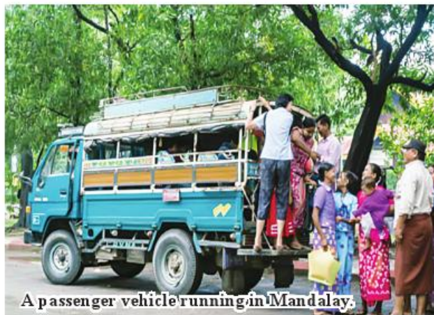
A passenger vehicle running in Mandalay.

of March, the number of passengers riding bus lines 1, 2, and 3 in Mandalay City has reached over 2,500 per day. 184