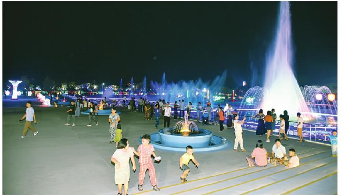
(၇၉)နှစ်မြောက် တပ်မတော်နေ့ကို ဂုဏ်ပြုသောအားဖြင့် နေပြည်တော်ရှိ တပ်မတော်ပန်းခြံတွင် မီးအလှူများ၊ ပန်းအလှူများဖြင့် အလှူဆင်ထားရာ လာရောက်အပန်းဖြေလည်ပတ်သူများဖြင့် ဧည့်ကားနေမှုကို တွေ့ရစဉ်။

made အလှူမီးများဖြင့်လည်းကောင်း၊ မင်းကြီးသုံးပိန်းရုပ်တုအောက်၌ တပ်မတော် အလံပုံဖော်ထားသည့် ကြယ်တံဆိပ် နှစ်ခုကို LED Strip Light များဖြင့်လည်းကောင်း၊ အသီးသီးပုံဖော်အလှူဆင်ထားသည့်ကို ခမ်းနားထည်ဝါစွာ တွေ့မြင်နိုင်မည်ဖြစ်သည်။ ထို့ပြင် ၂၀၂၄ ခုနှစ် (၇၉)နှစ်မြောက် တပ်မတော်နေ့ကို ဂုဏ်ပြုသောအားဖြင့် နေပြည်တော် စစ်ရေးပြတွင်းကြီးရှေ့ရှိ တပ်မတော်ပန်းခြံတွင်လည်း မီးအလှူများဖြင့် ဖန်တီးပုံဖော်ထားသည့် ပြည်ထောင်စု သမ္မတမြန်မာနိုင်ငံတော်အလံနှင့် (၇၉) နှစ်မြောက် တပ်မတော်နေ့အထိမ်းအမှတ် တံဆိပ်၊ တပ်မတော် (ကြည်း၊ ရေ၊ လေ) တပ်ဖွဲ့များတွင် အသုံးပြုသည့် ယာဉ်ယန္တရားပုံစံငယ်များ၊ ရေယာဉ်ပုံစံငယ်များ၊ လေယာဉ်ပုံစံငယ်များ၊ ရဟတ်ယာဉ်ပုံစံငယ်များကို ပြသထားသည်။ ပန်းခြံအတွင်း ပိုင်ဘာဖြင့်ပြုလုပ်ထားသည့် စစ်သည်ရုပ်တုငယ်များ၊ ပုံဖော်ထားသည့်