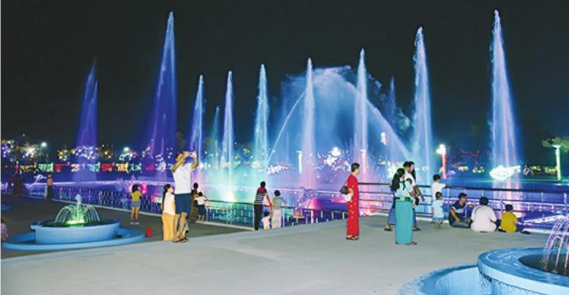
(၇၉)နှစ်မြောက် တပ်မတော်နေ့ကို ဂုဏ်ပြုသောအားဖြင့် နေပြည်တော်ရှိ တပ်မတော်ပန်းခြံတွင် မီးအလှများ၊ ပန်းအလှများဖြင့် အလှဆင်ထားရာ လာရောက်အပန်းဖြေလည်ပတ်သူများဖြင့် စည်ကားနေမှုကို တွေ့ရစဉ်။

နေပြည်တော် မတ် ၃၁ ရေးဦးစီးချုပ်ရုံး(ကြည်း) ဝင်းအတွင်း၌ ထားရှိသည်။ ၂၀၂၄ ခုနှစ် မတ် ၂၇ ရက်တွင် မျိုးချစ်စိတ်ဓာတ် ရှင်သန်ထက်မြက်ပြီး အလားတူ ပင်လောင်းလမ်းဆုံမှ ကျရောက်သည့် (၇၉)နှစ်မြောက် ဇာတိသွေး၊ ဇာတိမာန်တက်ကြွစေမည့် စစ်ရေးပြကွင်းကြီးသို့ သွားရောက် တပ်မတော်နေ့ကို ဂုဏ်ပြုသောအားဖြင့် တပ်မတော်(ကြည်း)၊ ရေ၊ လေ စစ်သည် သည့် လမ်းတစ်လျှောက်တွင်လည်း နေပြည်တော်ကောင်စီနယ်မြေအတွင်းရှိ များ၏လှုပ်ရှားမှုပုံရိပ်များကို ဖော်ကျူး တပ်မတော်၏ ဆောင်ပုဒ်များကို ပင်လောင်းမီးပွိုင့်လမ်းဆုံနှင့် ကာကွယ် ထားသော ပို့စာကြီးများကို စိုက်ထူ စာမျက်နှာ ၁၈ ကော်လံ ၁၂။