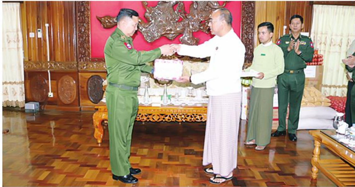
ရှမ်းပြည်နယ်ဝန်ကြီးချုပ် ဦးအောင်အောင်က လုံခြုံရေးတာဝန်များကို စွမ်းစွမ်းတမ်းတမ်းဆောင်ခဲ့သည့် လုံခြုံရေးတပ်ဖွဲ့ဝင်များအတွက် ဂုဏ်ပြုချီးမြှင့်ငွေနှင့် စားသောက်ဖွယ်ရာများ ပေးအပ်စဉ်။