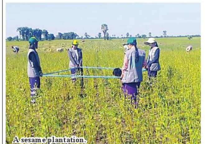
A sesame plantation.

Bamauk March 31 said U Myint Soe, head of Katha District Agriculture Department stated that a total of 2,020 acres of winter sesame has been harvested in Bamauk Township of Sagaing Region this winter. It yielded 15.27 baskets of sesame per acre. Local farmers have so far harvested 2,020 acres of sesame. “The township grew 2,020 acres of winter sesame. These acres have been harvested at all. Local farmers do not grow sesame in monsoon but in winter. Our department helps local farmers expand sown acreage of sesame and use GAP,” incomes. 206