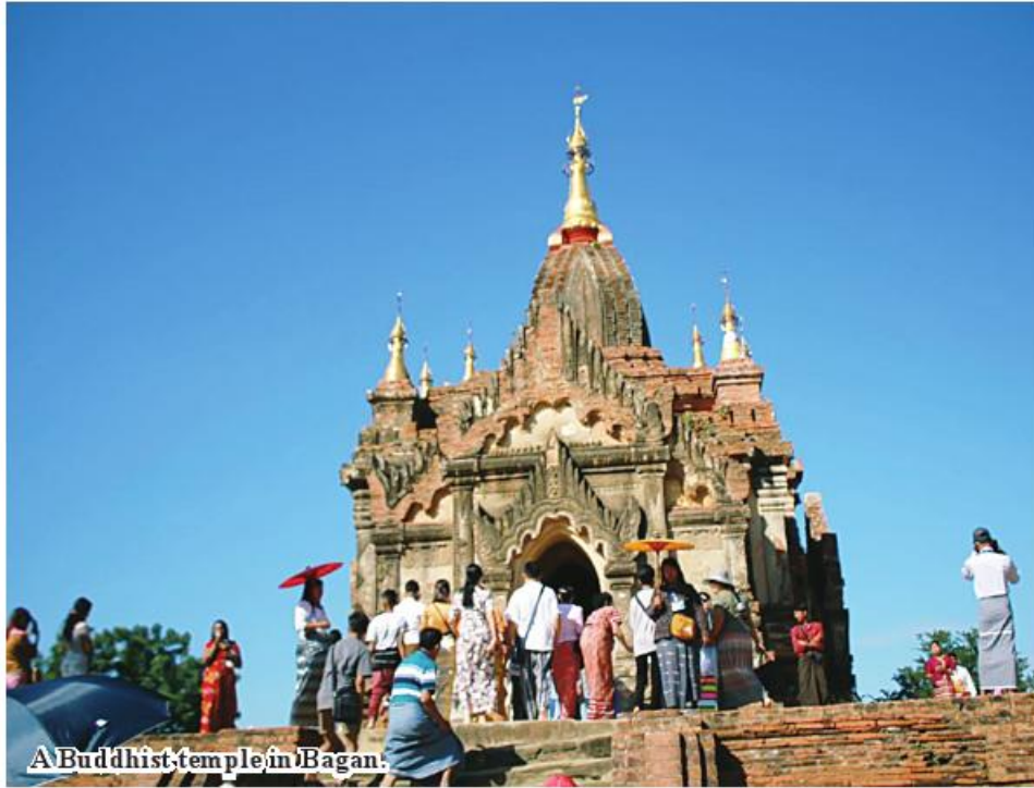
A Buddhist temple in Bagan.