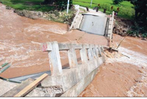
နမ့်လပ်ချောင်းကူးတံတား ပြိုကျပျက်စီးခဲ့သည့်ပုံ။

၁၉ ပေရှိ နမ့်လပ်ချောင်းကူး သံကွက္ကန့်ကရစ်တံတားသည် စက်တင်ဘာ ၁၀ ရက် နံနက် ၇ နာရီခွဲခန့်တွင် ပြိုကျပျက်စီးခဲ့ပြီး လူနှင့် တိရစ္ဆာန်များ ထိခိုက်ပျက်စီးမှုမရှိဘဲ မော်တော်ယာဉ်များ ဖြတ်သန်းသွားလာနိုင်မှုမရှိခဲ့ကြောင်း သိရသည်။ စာမျက်နှာ ၁၂ ကော်လံ ၅ ၂