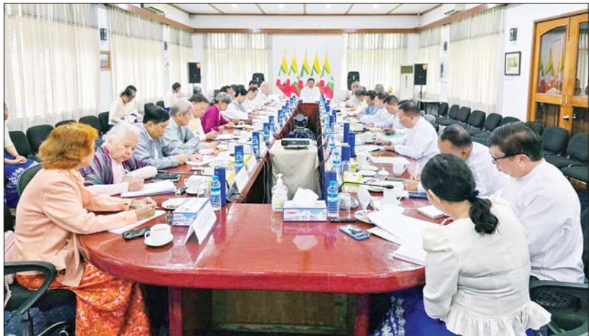
စစ်လျဉ်း၍ ဆွေးနွေးအမှာစကား ပြောကြားသည်။ (ယာပုံ) မြန်မာနိုင်ငံမဟာဗျူဟာနှင့် နိုင်ငံ တကာလေ့လာရေးအဖွဲ့ဥက္ကဋ္ဌနှင့် အဖွဲ့ ဝင်များက အဖွဲ့၏ လုပ်ငန်းအကောင် အထည်ဖော်ဆောင်ရွက်နေမှုအခြေအနေ များနှင့် နိုင်ငံတကာနှင့် ပြည်တွင်းရေး အခြေအနေတို့နှင့်စပ်လျဉ်း၍ အသိပညာ ရှင်များရှုထောင့်မှ ဆွေးနွေးတင်ပြခဲ့ကြ သည်။

နေပြည်တော် စက်တင်ဘာ ၂၃ ဒုတိယဝန်ကြီးချုပ်နှင့် နိုင်ငံခြားရေး ဝန်ကြီးဌာန ပြည်ထောင်စုဝန်ကြီး ဦးသန်းဆွေနှင့် မြန်မာနိုင်ငံမဟာဗျူဟာ နှင့် နိုင်ငံတကာလေ့လာရေးအဖွဲ့ ဥက္ကဋ္ဌ ဦးဆောင်သောအဖွဲ့တို့ တွေ့ဆုံဆွေးနွေး ပွဲကို ယနေ့နံနက် ၁၁ နာရီတွင် ရန်ကုန် မြို့ရှိ မြန်မာနိုင်ငံမဟာဗျူဟာနှင့် နိုင်ငံ တကာလေ့လာရေးအဖွဲ့ရုံးအစည်းအဝေး ခန်းမ၌ ကျင်းပသည်။ ဆွေးနွေးပွဲတွင် ပြည်ထောင်စုဝန်ကြီး က လက်ရှိနိုင်ငံတကာအခင်းအကျင်း များ၊ နိုင်ငံတကာ လတ်တလောဖြစ်ပေါ် တိုးတက်မှုများ၊ ပြည်တွင်းနိုင်ငံရေးအခြေ အနေနှင့် မြန်မာနိုင်ငံ မဟာဗျူဟာနှင့် နိုင်ငံတကာလေ့လာရေးအဖွဲ့၏ ဦးစားပေး ဆောင်ရွက်ရမည့် ရှေ့လုပ်ငန်းစဉ်များနှင့်