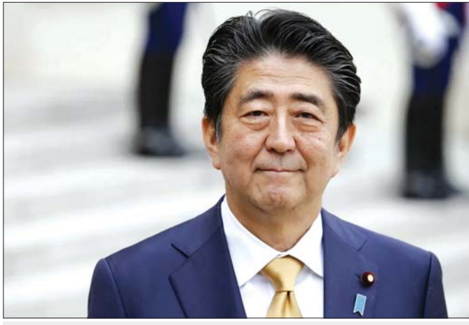
၂၀၂၂ ခုနှစ် ဇူလိုင်လ ၈ ရက်နေ့က လုပ်ကြံခြင်းခံခဲ့ရသည့် ဝန်ကြီးချုပ်ဟောင်း ရင်စိုအာဘေး။

ဝန်ကြီးချုပ် ကီရှီဒါလက်ထက်မှာ ဖြစ်ပေါ်ခဲ့တဲ့ ဝန်ကြီးချုပ်ဟောင်း ရင်စိုအာဘေးကို လုပ်ကြံသတ်ဖြတ်တဲ့အထိ ဖြစ်လာစေခဲ့တဲ့ Unification Church နဲ့ အယ်လ်ဒီပီပါတီဝင် လွှတ်တော်အမတ်တွေ ဆက်နွယ်နေတဲ့ ဘာသာရေး အရှုပ်တော်ပုံရယ်၊ အယ်လ်ဒီပီပါတီတွင်းက အစုအဖွဲ့ (faction) တွေရဲ့ နိုင်ငံရေးရန်ပုံငွေထိမ်ချန်မှု အရှုပ်တော်ပုံတွေဟာ ဝန်ကြီးချုပ် ကီရှီဒါအစိုးရအဖွဲ့အပေါ် ပြည်သူလူထုရဲ့ ထောက်ခံမှုကို အနိမ့်ဆုံးအဆင့်အထိ ကျဆင်းစေခဲ့ပါတယ်။ ၂၀၂၄ ခုနှစ် ဇူလိုင်လအတွင်းမှာ ယိုမီယူရီ ရှင်ဘွန်းသတင်းစာကြီးက ကောက်ခံခဲ့တဲ့ လူထုစစ်တမ်းမှာ ကီရှီဒါအစိုးရအပေါ် လူထုထောက်ခံမှုနှုန်းဟာ ၂၃ ရာခိုင်နှုန်းအထိ ကျဆင်းခဲ့ပါတယ်။ ဒီလိုကျဆင်းတာဟာ ၂၀၂၁ ခုနှစ် အောက်တိုဘာလမှာ ကီရှီဒါဝန်ကြီးချုပ်တာဝန် ထမ်းဆောင်ပြီးနောက်ပိုင်း အနိမ့်ဆုံးအဆင့်ကို