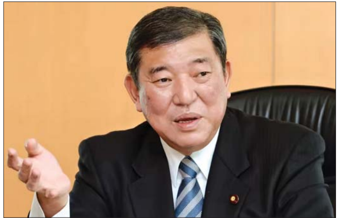
ကာကွယ်ရေးဝန်ကြီးဟောင်း ရှိဂဲရု အိဂိုဟာ။

မစ္စတာ ရှင်ဂိုရို ကိုအိဇုမိဟာ သူ့ဖခင် မစ္စတာ ဂျူနိုချိုရို ကိုအိဇုမိ နိုင်ငံရေးလောက ကနေ အနားယူတော့ ဖခင်ရဲ့ မဲဆန္ဒနယ်ဖြစ်တဲ့ ကာနာဂါဝါပြည်နယ် ကနေ လွှတ်တော်အမတ်အဖြစ် ၂၀၀၉ ခုနှစ်မှာ စတင်ဝင်ရောက်ယှဉ်ပြိုင်ပြီး ရွေးချယ်ခံခဲ့ရပါတယ်။ ၂၀၀၉ ခုနှစ်ဟာ အယ်လီဒီပီပါတီရဲ့ သမိုင်းမှာ ထူးခြားတဲ့နှစ်ဖြစ်ပါတယ်။ အဲဒီနှစ်မှာ ကျင်းပပြုလုပ်တဲ့ အောက်လွှတ်တော်ရွေးကောက်ပွဲမှာ အယ်လီဒီပီပါတီဟာ အတိုက်အခံ ဒီမိုကရက်တစ်ပါတီ (Democratic Party of Japan-DPJ) ကို