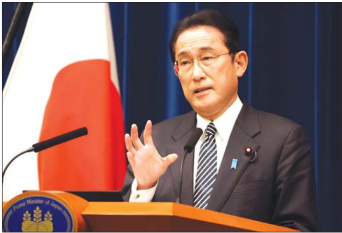
ဂျပန်နိုင်ငံ အယ်လ်ဒီပီပါတီ၏ လက်ရှိဥက္ကဋ္ဌနှင့် ဂျပန်ဝန်ကြီးချုပ် ကီရိုဒါက လာမည့်ရွေးကောက်ပွဲ တွင် ပါဝင်ယှဉ်ပြိုင်တော့မည်မဟုတ်ကြောင်း ဩဂုတ်လ ၁၄ ရက်နေ့က ကြေညာခဲ့စဉ်။

လာမယ့် စက်တင်ဘာလ ၂၇ ရက်နေ့မှာ ပြုလုပ် မယ့် အယ်လ်ဒီပီပါတီဥက္ကဋ္ဌ ရွေးချယ်ပွဲဟာ ယခင် ပြုလုပ်ခဲ့တဲ့ ရွေးချယ်ပွဲတွေနဲ့ သိသာထင်ရှားတဲ့ ကွဲပြားခြားနားမှုတွေ အများကြီးရှိပါတယ်။ ဘာကြောင့် ကွဲပြားခြားနားမှုတွေ ဖြစ်ရတာလည်း ဆိုတာသိနိုင်ဖို့ ပြီးခဲ့တဲ့နှစ်တွေအတွင်း ဂျပန်နိုင်ငံ ရဲ့ ပြည်တွင်းနိုင်ငံရေး ထူးခြားဖြစ်စဉ်တွေကို ပြန်လည်လေ့လာကြည့်ဖို့လိုပါတယ်။ အဓိက