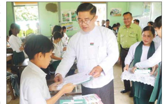
ဆရာ ဆရာမ ၃၃ ဦးနှင့် ကျောင်းသား သင်ရိုးညွှန်းတမ်းစာအုပ်များကို လက်ဝယ် ကျောင်းသူ ၂၉၂ ဦးအတွက် စုစုပေါင်း အရောက် ထောက်ပံ့ပေးအပ်ခဲ့ကြောင်း ငွေကျပ် ၇၄၂၁၅၀ တန်ဖိုးရှိ ကျောင်း သိရသည်။ (အပေါ်ပုံ) ပြည်နယ်(ပြန်/ဆက်)

ထို့နောက် ပြည်နယ်ပညာရေးမှူးနှင့် ဆရာ ဆရာမများက ရေဘေးသင့်ဆရာ ဆရာမများနှင့် ကျောင်းသား ကျောင်းသူ များအတွက် ဖြည့်ဆည်းဆောင်ရွက်ပေး ရန် လိုအပ်ချက်များ၊ အခက်အခဲများကို ဆွေးနွေးတင်ပြကြရာ ပြည်နယ်ဝန်ကြီး ချုပ်က ပေါင်းစပ်ညှိနှိုင်း ဆောင်ရွက်ပေး ခဲ့ပြီး ကျောင်းအုပ်ဆရာမကြီးများနှင့် ဆရာ ဆရာမများကို ကျောင်းဝတ်စုံများ ထောက်ပံ့ပေးအပ်သည်။ ယင်းနောက် ပြည်နယ်ဝန်ကြီးချုပ်နှင့် တာဝန်ရှိသူများက အလက(၂)တွင် ယာယီတွဲဖက်၍ စာသင်ကြားလျက်ရှိ သော ရေဘေးရှောင် ကျောင်းသား ကျောင်းသူများအား ရင်းရင်းနှီးနှီးတွေ့ဆုံ အားပေးစကားပြောကြားပြီး သင်ကြား ရေးတွင် အခက်အခဲများ မဖြစ်စေရေး