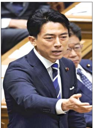
သဘာဝပတ်ဝန်းကျင်ထိန်းသိမ်းရေး ဝန်ကြီးဟောင်း ရှင်ဂိုရို ကိုအိဇုမိ။

အသက် ၆၇ နှစ်အရွယ်ရှိတဲ့ မစ္စတာ ရှိဂဲရု အိဂိုဟာ အစိုးရအဖွဲ့နဲ့ ပါတီအတွင်းမှာ အရေးပါတဲ့ တာဝန်အမျိုးမျိုး ထမ်းဆောင်ခဲ့သူတစ်ဦး ဖြစ်တာကြောင့် အတွေ့အကြုံ များပြားကြွယ်ဝသူ တစ်ဦးဖြစ်သလို ဂျပန်ပြည်သူ့ထုအကြား ရေပန်းစားသူတစ်ဦး ဖြစ်ပါတယ်။ စက်တင်ဘာလ ၂၇ ရက်နေ့ ရွေးချယ်ပွဲအတွက် လူထုစစ်တမ်း ကောက်ယူမှုအကြိမ်တိုင်းမှာ ထောက်ခံမှုအများဆုံး