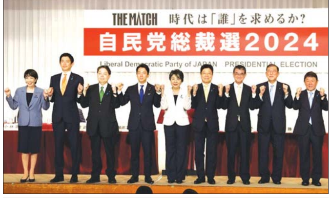
အယ်လ်ဒီပီပါတီ ဥက္ကဋ္ဌရာထူးအတွက် ဝင်ရောက်ယှဉ်ပြိုင်ကြမည့် ကိုယ်စားလှယ်လောင်း ကိုးဦး။

အစုအဖွဲ့ (Kishida faction) ဟာ နိုင်ငံရေးရန်ပုံငွေ ယန်း ၂၂၉ ဒသမ ၃၅ သန်း ရရှိခဲ့ရာမှာ ၈၀ ရာခိုင် နှုန်းက အခမ်းအနားတွေက ရရှိခဲ့တာ ဖြစ်ပါတယ်။ အလားတူ အယ်လ်ဒီပီပါတီရဲ့ ဒုတိယဥက္ကဋ္ဌ မစ္စတာ တာရို အာဆိုရဲ့ ပါတီအစုအဖွဲ့ (Aso faction) နိုင်ငံ ရေးရန်ပုံငွေ ယန်း ၂၈၆ ဒသမ ၅၈ သန်း ရရှိခဲ့ရာမှာ ၈၀ ရာခိုင်နှုန်းက အခမ်းအနားတွေက ရရှိခဲ့တာ ဖြစ်ပါတယ်။ ဂျပန်နိုင်ငံရဲ့ နိုင်ငံရေးရန်ပုံငွေအရ ပါတီအစုအဖွဲ့တွေအနေနဲ့ နိုင်ငံရေးရန်ပုံငွေ ရှာဖွေဖို့ အခမ်းအနားတွေပြုလုပ်ရာမှာ တစ်နှစ် အတွင်း တစ်သိးပုဂ္ဂလိက တစ်ဦးတစ်ယောက် (သို့မဟုတ်) စီးပွားရေးကုမ္ပဏီကြီးတစ်ခုက ယန်း ၂၀၀၀၀၀ ထက်ကျော်လွန်ပြီး လက်မှတ်ဝယ်ယူခဲ့ မယ်ဆိုရင် အစီရင်ခံစာမှာ တရားဝင်ထည့်သွင်း ဖော်ပြသွားရမယ့်လို့ သတ်မှတ်ထားပါတယ်။ နိုင်ငံ ရေး ပါတီအစုအဖွဲ့တွေအနေနဲ့ နိုင်ငံရေးရန်ပုံငွေ ဥပဒေနဲ့ညီညွတ်နေသမျှ ရန်ပုံငွေရှာဖွေမှုဟာ ပြဿနာမရှိဘူးလို့ ပြောနိုင်ပါတယ်။