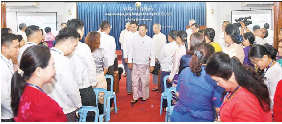
ဒုတိယဝန်ကြီးချုပ်နှင့် နိုင်ငံခြားရေးဝန်ကြီးဌာန ပြည်ထောင်စုဝန်ကြီး ဦးသန်းဆွေ အခြေခံသံတမန်ရေးရာကျွမ်းကျင်မှု သင်တန်းအမှတ်စဉ် (၄၆/၂၀၂၄)မှ သင်တန်းသား သင်တန်းသူများအား ရင်းရင်းနှီးနှီးနှုတ်ဆက်စဉ်။

ရန်ကုန် စက်တင်ဘာ ၂၄ နိုင်ငံခြားရေး ဝန်ကြီးဌာနက ဖွင့်လှစ်မည့် အခြေခံသံတမန် ရေးရာကျွမ်းကျင်မှု သင်တန်း အမှတ်စဉ်(၄၆/၂၀၂၄) နေပြည်တော်တန်းခွဲနှင့် ရန်ကုန်တန်းခွဲ တို့၏ သင်တန်းဖွင့်ပွဲအခမ်းအနား များကို ယနေ့နံနက် ၁၀ နာရီတွင် နိုင်ငံခြားရေးဝန်ကြီးဌာန နေပြည်တော်ရှိ လောကနတ်ခန်းမနှင့် ရန်ကုန်ရှိ ဝန်ခင်းမင်းရာဇဝန်ခန်းမ တို့၌ တစ်ပြိုင်တည်းကျင်းပရာ ဒုတိယဝန်ကြီးချုပ်နှင့် နိုင်ငံခြားရေးဝန်ကြီးဌာန ပြည်ထောင်စုဝန်ကြီး ဦးသန်းဆွေ ရန်ကုန်မြို့၌ တက်ရောက်၍ သင်တန်းဖွင့်ပွဲ အမှာစကားပြောကြားသည်။ အခမ်းအနားများသို့ နိုင်ငံခြားရေးဝန်ကြီးဌာန ဒုတိယဝန်ကြီး၊ အမြဲတမ်းအတွင်းဝန်၊ ပြည်ထောင်စုဝန်ကြီးရုံးနှင့် ဦးစီးဌာနများမှ ညွှန်ကြားရေးမှူးချုပ်များနှင့် တာဝန်ရှိသူများ၊ အငြိမ်းစားသံအမတ်ကြီးများ၊ ဝါရင့်သံတမန်များ၊ ဘာသာရပ်ဆိုင်ရာကျွမ်းကျင်သူများ၊ တက္ကသိုလ်များမှ ပါမောက္ခဆရာကြီး ဆရာမကြီးများ၊ သင်တန်းသား သင်တန်းသူများ တက်ရောက်ကြသည်။ ၂၀၀ ခန့် တက်ရောက်အခြေခံ သံတမန်ရေးရာကျွမ်းကျင်မှုသင်တန်း အမှတ်စဉ် (၄၆/၂၀၂၄) ကို နိုင်ငံခြားရေးဝန်ကြီးဌာန (နေပြည်တော်) နှင့် နိုင်ငံခြားရေးဝန်ကြီးဌာန(ရန်ကုန်) တို့တွင် တန်းခွဲနှစ်ခုဖြင့် စက်တင်ဘာ ၂၄ ရက်မှ ဒီဇင်ဘာ ၁၃ ရက်အထိ ရက်သတ္တ ၁၂ ပတ်ကြာ ရုံးဖွင့်ရက်များတွင် နံနက် ၇ နာရီမှ ၉ နာရီအထိ ဖွင့်လှစ်ပို့ချသွားမည် ဖြစ်ပြီး အစိုးရအဖွဲ့အစည်းများနှင့် ဝန်ကြီးဌာနများမှ ဝန်ထမ်းများ