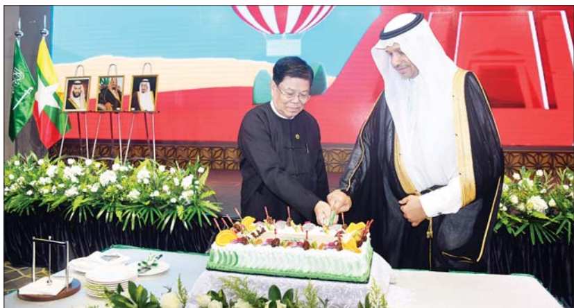
ယင်းနောက် ဧည့်ခံပွဲသို့တက်ရောက် လာကြသူများအား သံအမတ်ကြီးက ညစာစားပွဲဖြင့် တည်ခင်းဧည့်ခံသည်။ အဆိုပါဧည့်ခံပွဲအခမ်းအနားသို့ ရန်ကုန် မြို့ နိုင်ငံခြားသံရုံးများမှ သံအမတ်ကြီး များ၊ သံရုံးယာယီတာဝန်ခံများ၊ စစ်သံမှူး များ၊ ကုလသမဂ္ဂဆိုင်ရာဌာနကော်မတီ များနှင့် ဖိတ်ကြားထားသူများ တက်ရောက် ကြကြောင်း သတင်းရရှိသည်။ သတင်းစဉ်

ရန်ကုန် စက်တင်ဘာ ၂၃ ဆော်ဒီအာရေဗျနိုင်ငံ၏ (၉၄) နှစ်မြောက် အမျိုးသားနေ့ အထိမ်းအမှတ်ဧည့်ခံပွဲ အခမ်းအနားကို ယနေ့ညနေ ၆ နာရီခွဲတွင် ရန်ကုန်မြို့ Wyndham Grand Hotel ၌ ကျင်းပရာ ဒုတိယဝန်ကြီးချုပ်နှင့် နိုင်ငံခြားရေးဝန်ကြီးဌာန ပြည်ထောင်စုဝန်ကြီး ဦးသန်းဆွေ တက်ရောက်သည်။ ဦးစွာ မြန်မာနိုင်ငံဆိုင်ရာ ဆော်ဒီ H.E.Mr.Saud Abdullah Alsubaie က အာရေဗျနိုင်ငံသံအမတ်ကြီး H.E. Mr.Saud Abdullah Alsubaie နှင့် တာဝန်ရှိသူများက ဆက်လက်၍ ဒုတိယဝန်ကြီးချုပ်နှင့် ဒုတိယဝန်ကြီးချုပ်နှင့် နိုင်ငံခြားရေး ပြည်ထောင်စုဝန်ကြီးနှင့် မြန်မာနိုင်ငံ ဝန်ကြီးဌာန ပြည်ထောင်စုဝန်ကြီး ဦးသန်းဆွေနှင့် ဧည့်ခံပွဲအခမ်းအနားသို့ H.E.Mr.Saud Abdullah Alsubaie တို့က တက်ရောက်လာကြသူများအား ရင်းရင်း ဆော်ဒီအာရေဗျနိုင်ငံ၏(၉၄)နှစ်မြောက် အမျိုးသားနေ့ အထိမ်းအမှတ်ကိတ်ကို နှီးနှီး ကြိုဆိုနှုတ်ဆက်ကြသည်။ ထို့နောက် ပြည်ထောင်စုသမ္မတ လူ့အဖွဲ့အစည်း နိုင်ငံတော်သီချင်းနှင့် မြန်မာနိုင်ငံတော် နိုင်ငံတော်သီချင်းနှင့် ဆော်ဒီအာရေဗျနိုင်ငံ နိုင်ငံတော်သီချင်း တို့ဖြင့် အခမ်းအနားကို ဖွင့်လှစ်သည်။ ယင်းနောက် မြန်မာနိုင်ငံဆိုင်ရာ ဆော်ဒီအာရေဗျနိုင်ငံ သံအမတ်ကြီး