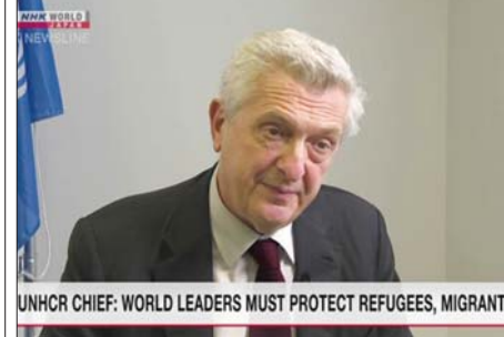
UNHCR CHIEF: WORLD LEADERS MUST PROTECT REFUGEES, MIGRANTS