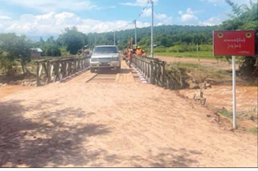
နမ့်လပ်ချောင်းကူးတံတား ပြန်လည်တည်ဆောက်ပြီးပုံ။