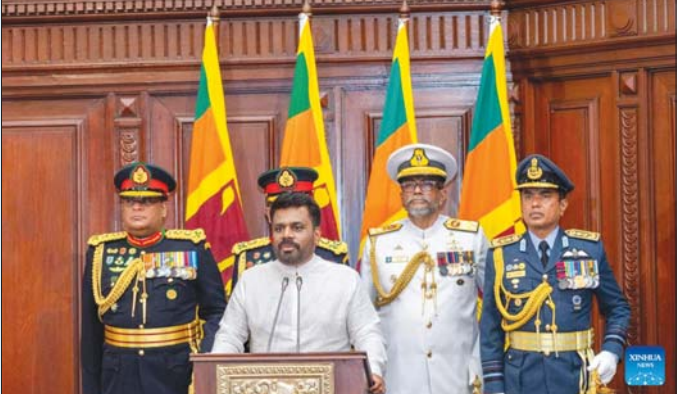
သီရိလင်္ကာသမ္မတသစ် ဒစ္စနာယာကီ ကျမ်းသစ္စာကျိန်ဆိုပွဲတွင် မိန့်ခွန်းပြောကြားစဉ်။

ဒစ္စနာယာကီကို မြောက်အလယ်ပိုင်းပြည်နယ် အနုရာဒပူရရိုင်ရှိ ရွာတစ်ရွာ၌ ၁၉၆၈ ခုနှစ် နိုဝင်ဘာ ၂၄ ရက်တွင် မွေးဖွားခဲ့သည်။ ကျောင်းတက်နေစဉ်ကတည်းက ဂျာနာသမီဇ်တတ်ကိသီ ပယ်ရု မုနာ ပါတီ (ဂျေပီပီ) ၏ လှုပ်ရှားမှုများတွင် ပါဝင်ခဲ့ပြီး ၁၉၈၇ ခုနှစ်တွင် အဆိုပါ ပါတီသို့ဝင်ရောက်ကာ နိုင်ငံရေးလှုပ်ရှားမှုများတွင် တက်ကြွစွာပါဝင်ခဲ့သည်။ ၎င်းသည် ၁၉၉၅ ခုနှစ်တွင် ကီလာနီယာတက္ကသိုလ်မှ ရူပဗေဒ အထူးပြုဖြင့် သိပ္ပံဘွဲ့ရခဲ့ပြီး ၁၉၉၈ ခုနှစ်တွင် ဂျေပီပီပါတီ၏ နိုင်ငံရေးဗျူရိုအဖွဲ့ဝင်ဖြစ်လာသည်။