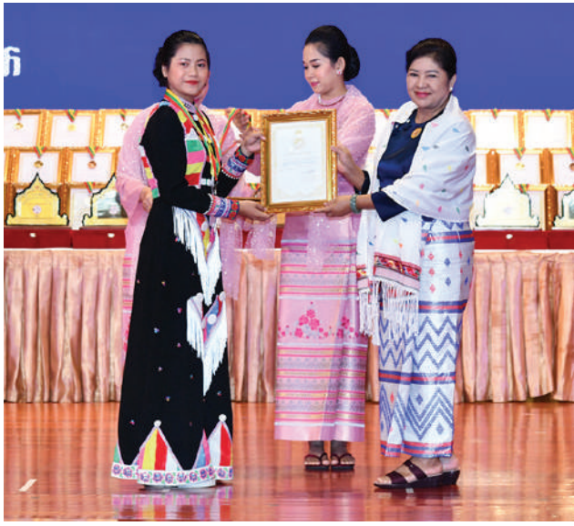
နိုင်ငံတော်စီမံအုပ်ချုပ်ရေးကောင်စီအဖွဲ့ဝင် ဒေါ်ခွဲဘူ ခေတ်ဟောင်း၊ ကာလပေါ်အဆိုပြိုင်ပွဲ အမျိုးသမီးပြိုင်ပွဲတွင် အခြေခံပညာအဆင့် (အသက် ၁၅ နှစ်မှ ၂၀ နှစ်အတွင်း)၌ ဆုရရှိသူတစ်ဦးကို ဂုဏ်ပြု ဆုတံဆိပ်နှင့် ဂုဏ်ပြုမှတ်တမ်းလွှာ ပေးအပ်ချီးမြှင့်စဉ်။