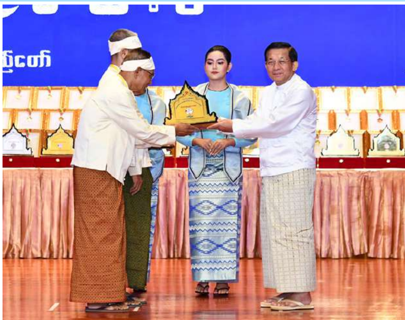
နိုင်ငံတော်စီမံအုပ်ချုပ်ရေးကောင်စီဥက္ကဋ္ဌ နိုင်ငံတော်ဝန်ကြီးချုပ် ဗိုလ်ချုပ်မှူးကြီး မင်းအောင်လှိုင် ရခိုင်ပြည်နယ် တိုင်းရင်းသားရိုးရာအကအဖွဲ့အား ဂုဏ်ပြုဆုပေးအပ် ချီးမြှင့်စဉ်။

ယခုကျင်းပပြီးစီးခဲ့သည့် မြန်မာ့ရိုးရာ ယဉ်ကျေးမှု အဆို၊ အက၊ အရေး၊ အတီး