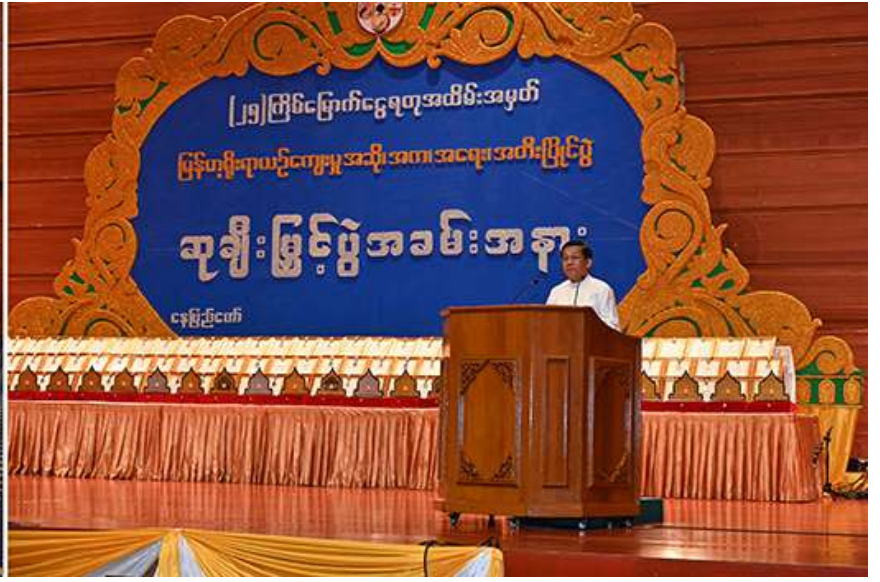
နိုင်ငံတော်စီမံအုပ်ချုပ်ရေးကောင်စီဥက္ကဋ္ဌ နိုင်ငံတော်ဝန်ကြီးချုပ် ဗိုလ်ချုပ်မှူးကြီးမင်းအောင်လှိုင် (၂၅)ကြိမ်မြောက် ငွေရတုအထိမ်းအမှတ် မြန်မာ့ရိုးရာယဉ်ကျေးမှု အဆို၊ အက၊ အရေး၊ အတီးပြိုင်ပွဲ ဆုချီးမြှင့်ပွဲ အခမ်းအနား တွင် အမှာစကားပြောကြားစဉ်။

၂၆ ရှေ့ဖိုးမှအဆက် တိုင်းဒေသကြီးနှင့် ပြည်နယ်များမှ ရိုးရာ ယဉ်ကျေးမှုအကအဖွဲ့များနှင့် တာဝန်ရှိသူ များ တက်ရောက်ကြသည်။