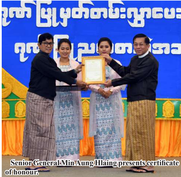
Senior General Min Aung Hlaing presents certificate of honour.