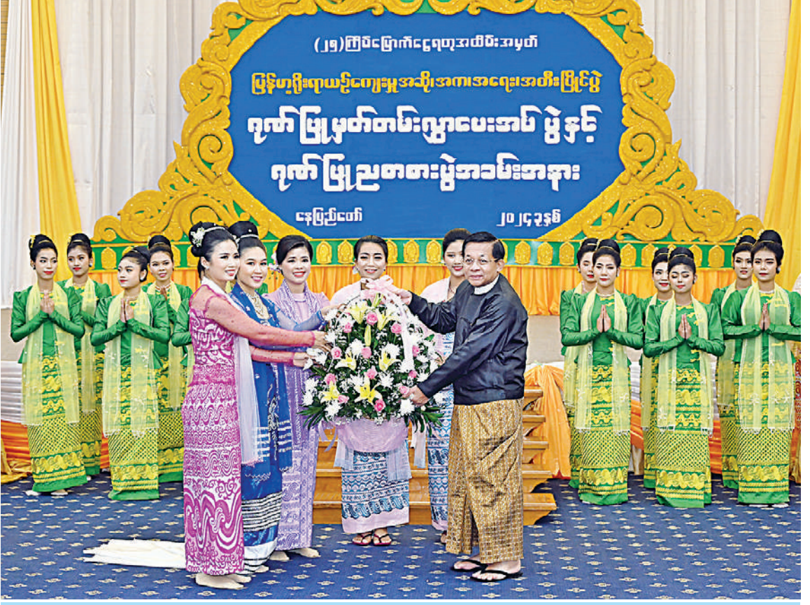
နိုင်ငံတော်စီမံအုပ်ချုပ်ရေးကောင်စီဥက္ကဋ္ဌ နိုင်ငံတော်ဝန်ကြီးချုပ် ဗိုလ်ချုပ်မှူးကြီးမင်းအောင်လှိုင် သီဆိုဖျော်ဖြေခဲ့ကြသည့် အနုပညာရှင်များအား ဂုဏ်ပြုပုဒ်းခြင်းပေးအပ်စဉ်။

မြန်မာ့အသံနှင့် ရုပ်မြင်သံကြားမှ အနု ပညာရှင်များနှင့် ပြည်သူ့ဆက်ဆံရေးနှင့် စိတ်ဓာတ်စစ်ဆင်ရေးညွှန်ကြားရေးမှူးရုံး ကွပ်ကဲမှုအောက် မြဝတီတေးဂီတအဖွဲ့မှ အနုပညာရှင်များက တေးသံသာများဖြင့် သီဆို၊ တီးမှုတ်၊ ကပြဖျော်ဖြေကြသည်။ ဂုဏ်ပြုညစာစားပွဲအပြီးတွင် နိုင်ငံ တော်စီမံအုပ်ချုပ်ရေးကောင်စီဥက္ကဋ္ဌ နိုင်ငံ တော်ဝန်ကြီးချုပ်က သီဆိုဖျော်ဖြေခဲ့ကြ သည့် အနုပညာရှင်များကို ဂုဏ်ပြုပုဒ်း ခြင်းပေးအပ်ပြီး ရင်းရင်းနှီးနှီး နှုတ်ဆက်ခဲ့ ကြကြောင်း သတင်းရရှိသည်။ (၅၀၁)