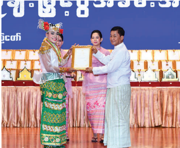
နိုင်ငံတော်စီမံအုပ်ချုပ်ရေးကောင်စီအဖွဲ့ဝင် ခွန်စံလွင် အကပြိုင်ပွဲ အမျိုးသား ဝါသနာရှင်အဆင့် (ပထမတန်း)တွင် ဆုရရှိသူတစ်ဦးကို ဂုဏ်ပြုဆုတံဆိပ်နှင့် ဂုဏ်ပြုမှတ်တမ်းလွှာပေးအပ်ချီးမြှင့်စဉ်။