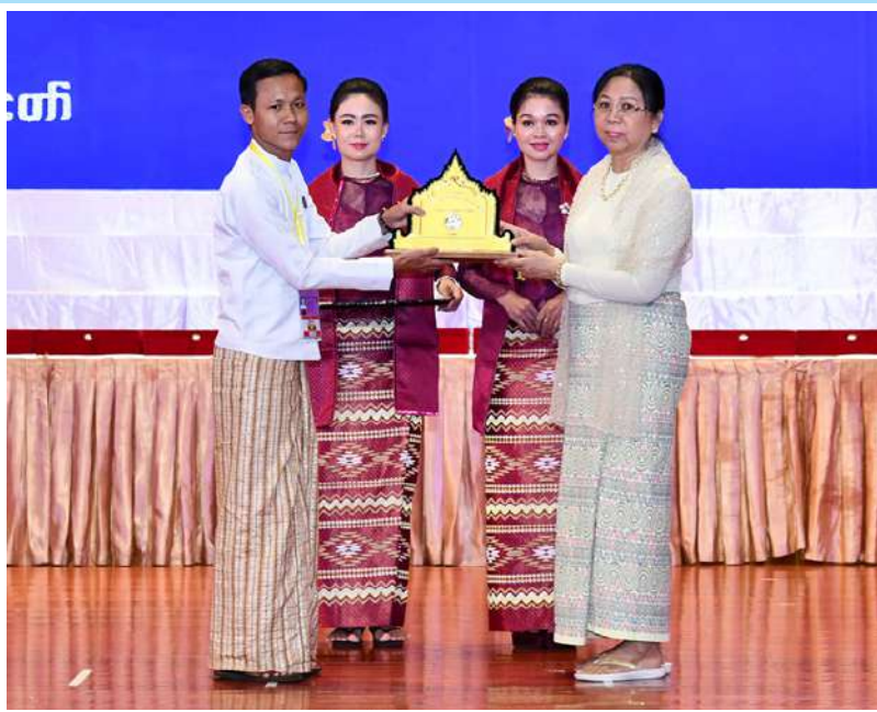
နိုင်ငံတော်စီမံအုပ်ချုပ်ရေးကောင်စီဥက္ကဋ္ဌ နိုင်ငံတော်ဝန်ကြီးချုပ် ဗိုလ်ချုပ်မှူးကြီး မင်းအောင်လှိုင်၏ ဇနီး ဒေါ်ကြူကြူလှ ရုပ်စုံသဘင်အဖွဲ့လိုက်ပြိုင်ပွဲတွင် ပထမဆုရရှိသည့် အဖွဲ့အား ဂုဏ်ပြုဆုတံဆိပ်နှင့် ဂုဏ်ပြုမှတ်တမ်းလွှာပေးအပ်ချီးမြှင့်စဉ်။