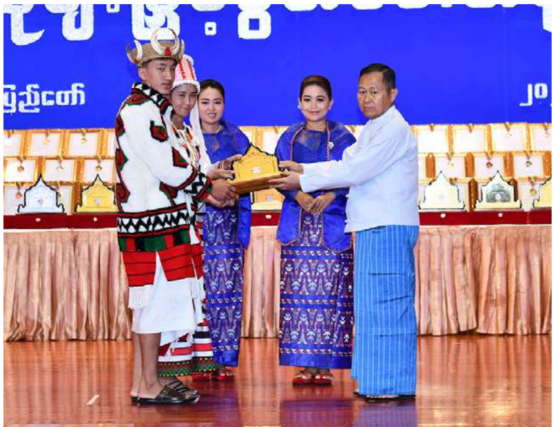
နိုင်ငံတော်စီမံအုပ်ချုပ်ရေးကောင်စီ ဒုတိယဥက္ကဋ္ဌ ဒုတိယဝန်ကြီးချုပ် ဒုတိယ ဗိုလ်ချုပ်မှူးကြီးစိုးဝင်း ကချင်ပြည်နယ် တိုင်းရင်းသားရိုးရာယဉ်ကျေးမှုအဖွဲ့အား ဂုဏ်ပြုဆုပေးအပ်ချီးမြှင့်စဉ်။