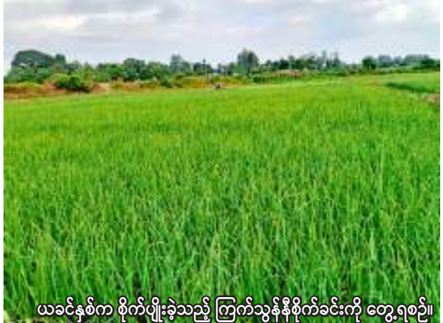
ယခင်နှစ်က စိုက်ပျိုးခဲ့သည့် ကြက်သွန်နီစိုက်ခင်းကို တွေ့ရစဉ်။