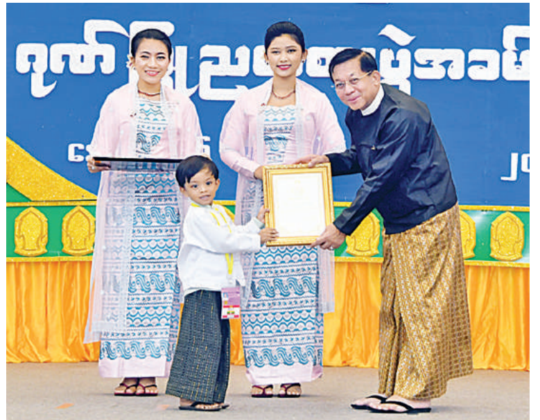
နိုင်ငံတော်စီမံအုပ်ချုပ်ရေးကောင်စီဥက္ကဋ္ဌ နိုင်ငံတော်ဝန်ကြီးချုပ် ဗိုလ်ချုပ်မှူးကြီးမင်းအောင်လှိုင် အကပြိုင်ပွဲ၌ အခြေခံပညာအဆင့် (အသက် ၁၀ နှစ်မှ ၁၅ နှစ်အတွင်း) အသက်အငယ်ဆုံးပြိုင်ပွဲဝင် မောင်ဟိန်းလင်းမာန်သွေးအား ဂုဏ်ပြုမှတ်တမ်းလွှာပေးအပ်ချီးမြှင့်စဉ်။

အဓိပ္ပာယ်ပြည့်စုံစွာ ကျင်းပနိုင်စေရေးနှင့် ပြိုင်ပွဲကြီး၏ ရည်ရွယ်ချက်များ တိုးတက်အကောင်အထည်ဖော်လာစေရေး အလေးထားကျင်းပပေးလျက်ရှိကြောင်း၊ ပြိုင်ပွဲကြီးများတွင် ပညာရှင်ကြီးများအားလုံးက တန်ဖိုးမဖြတ်နိုင်သည့် ပညာရပ်ဆိုင်ရာများကို ကူညီပံ့ပိုးဆောင်ရွက်ပေးလျက်ရှိကြသည့်အတွက် ကျေးဇူးတင်ဂုဏ်ပြုပါကြောင်းကို နိုင်ငံတော်၏ ကိုယ်စားအလေးအနက်ထား ပြောကြားလိုကြောင်း။