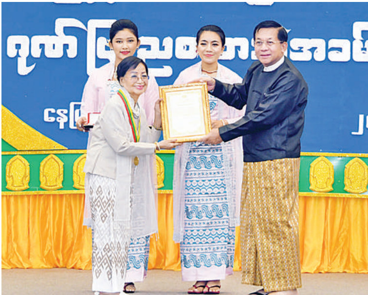
နိုင်ငံတော်စီမံအုပ်ချုပ်ရေးကောင်စီဥက္ကဋ္ဌ နိုင်ငံတော်ဝန်ကြီးချုပ် ဗိုလ်ချုပ်မှူးကြီးမင်းအောင်လှိုင် မြန်မာ့ရိုးရာယဉ်ကျေးမှု အဆို၊ အက၊ အရေး၊ အတီးပြိုင်ပွဲတွင် ပထမအကြိမ်မှ (၂၅)ကြိမ်မြောက် ငွေရတုအထိမ်းအမှတ်အထိ အကဖြတ်ပညာရှင်အဖြစ် တာဝန်ထမ်းဆောင်ခဲ့သည့် စည်သူဒေါ်ထားအား ဂုဏ်ပြုမှတ်တမ်းလွှာပေးအပ်ချီးမြှင့်စဉ်။

စေတနာအပြည့်အဝဖြင့် ပါဝင်ကူညီပံ့ပိုးပေးခဲ့ကြသည့် ဝါရင့်သမ္ဘာ့ရင့် အနုပညာရှင်ကြီးများ၊ ဗဟို၊ တိုင်းဒေသကြီးနှင့် ပြည်နယ်များမှ အကဖြတ်အဖွဲ့ဝင် အနုပညာရှင်များအားလုံးကို နိုင်ငံတော်စီမံအုပ်ချုပ်ရေးကောင်စီက ဂုဏ်ပြုကျင်းပသည့် အခမ်းအနားပင်ဖြစ်ကြောင်း။ ယခုပြိုင်ပွဲကြီးများကို နှစ်စဉ် အစဉ်အလာမပျက် အသွင်သဏ္ဍာန်သာမက အနှစ်သာရပါပိုမိုပြည့်စုံပြီး အမျိုးသားရေး