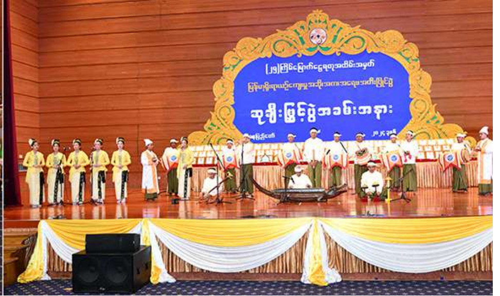
နိုင်ငံတော်စီမံအုပ်ချုပ်ရေးကောင်စီဥက္ကဋ္ဌ နိုင်ငံတော်ဝန်ကြီးချုပ် ဗိုလ်ချုပ်မှူးကြီးမင်းအောင်လှိုင်၊ ဇနီး ဒေါ်ကြူကြူလှနှင့် အဖွဲ့ဝင်များ ရခိုင်တိုင်းရင်းသားရိုးရာ တေးဂီတအဖွဲ့က “တူရိယာစုံစွ ရခိုင်ဂီတ”တေးသီချင်းဖြင့် ဖျော်ဖြေတင်ဆက်နေမှုကို ကြည့်ရှုအားပေးစဉ်။

အတွက် အနုပညာစွမ်းပကားဖြင့် ဆက်လက် ထိန်းသိမ်းကာကွယ် စောင့်ရှောက်သွားကြပါ ဟု အနုပညာရှင်ကြီးများနှင့်အတူ မျိုးဆက် သစ်အနုပညာရှင်များအားလုံးကို အလေးထား တိုက်တွန်းမှာကြားလိုကြောင်း။ သက်ဆိုင်ရာ တာဝန်ရှိသူများနှင့် အနုပညာရှင်များအားလုံးကို မှာကြားလိုသည် မှာ ပြည်ထောင်စုမြန်မာနိုင်ငံတော်ကြီး နိုင်ငံတကာအလယ်တွင် ဝင့်ဝင့်ထည်ထည် နှင့် ကမ္ဘာတည်သရွေ့တည်တံ့ခိုင်မြဲစေရန် အတွက် မြန်မာလူမျိုးတို့၏ ကိုယ်ပိုင် ယဉ်ကျေးမှု၊ ကိုယ်ပိုင်အနုပညာနှင့် ကိုယ်ပိုင် အမျိုးသားရေးစရိုက် လက္ခဏာများကို ဆက်လက် ရှင်သန်ထွန်းကားနေအောင် စွမ်းဆောင်ပေးကြရန်၊ နှစ်ပေါင်းထောင်ချီပြီး ခမ်းနားထည်ဝါစွာ ဖွံ့ဖြိုးစည်ပင်ခဲ့သည့် မြန်မာ့ရိုးရာယဉ်ကျေးမှု အနုပညာစစ်စစ်ကို မြတ်နိုးထိန်းသိမ်းရင်း မြန်မာတို့၏အမျိုး ဂုဏ်၊ ဇာတိဂုဏ်အစဉ်ထာဝရနိုးကြား ရှင်သန် နေစေရန် အနုပညာစွမ်းပကားဖြင့် ပူးပေါင်း