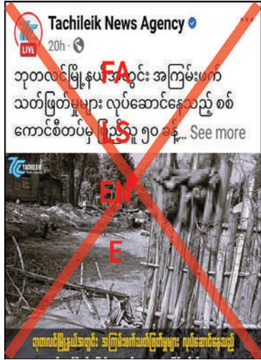
လာစေပြီး ဒေသတည်ငြိမ်အေးချမ်းမှုပျက်ပြားစေရန်အတွက်လှုံ့ဆော်ဝါဒဖြန့်သည့် သတင်းမှားများဖြင့် လုပ်ကြံရေးသားဖြန့်ဝေနေခြင်းသာဖြစ်ကြောင်း သတင်းရရှိသည်။ (၅၀၁)

ရွက်လျက်ရှိပြီး ဒေသခံပြည်သူများကို ဖမ်းဆီးခေါ်ဆောင် သတ်ဖြတ်ခြင်းမရှိကြောင်း၊ PDF အမည်ခံအကြမ်းဖက်သောင်းကျန်းသူများသည် ၎င်းတို့၏ အကြမ်းဖက်လုပ်ရပ်များကို ထောက်ခံအားပေးမှုမရှိသည့် ဘုတလင်မြို့နယ်စီပါကျေးရွာမှ အပြစ်မဲ့ပြည်သူ ခြောက်ဦးကို ရက်စက်စွာသတ်ဖြတ်ခဲ့သည့် ဖြစ်စဉ်ကို အောက်တိုဘာ ၂၁ ရက်တွင် နိုင်ငံပိုင်သတင်းမီဒီယာများက သတင်းထုတ်ပြန်ခဲ့ပြီးဖြစ်ကြောင်း၊ ယခုဖြစ်စဉ်တွင်လည်း အကြမ်းဖက်အားပေးတရားမဝင်ပြည်ပထုတ်ဝေမှုများက လုံခြုံရေးတပ်ဖွဲ့ဝင်များအပေါ် ပြည်သူများအထင်အမြင်လွှဲမှားစေရန်နှင့် အကြမ်းဖက်သမားများ၏ ဥပဒေမဲ့လူမဆန်သည့် ရက်စက်စွာသတ်ဖြတ်ခြင်း၊ အဖျက်အမှောင့်လုပ်ရပ်များကို ဖုံးကွယ်ရန်နှင့် အများပြည်သူစိုးရိမ်ထိတ်လန့်