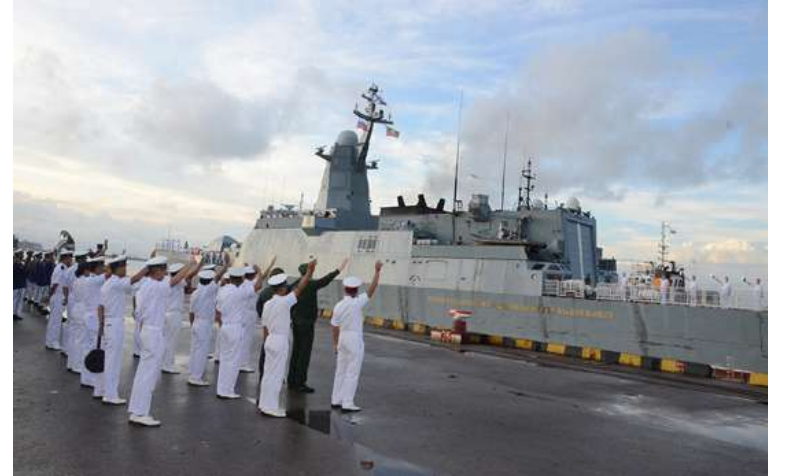
ရုရှားရေတပ် Russian Pacific Fleet မှ စစ်ရေယာဉ် လေးစီးအား တပ်မတော် (ရေ)မှ အရာရှိကြီးများ၊ အရာရှိ၊ စစ်သည်များ၊ မြန်မာနိုင်ငံဆိုင်ရာ ရုရှားစစ်သံမှူးနှင့် တာဝန်ရှိသူများက ပို့ဆောင်နှုတ်ဆက်ကြစဉ်။

တာဝန်ရှိသူများက ပို့ဆောင်နှုတ်ဆက်ခြင်း၊ ဂုဏ်ပြုစာစားပွဲများအပြန်အလှန် ကျင်းပခြင်းနှင့် ဆိပ်ကမ်းအခြေပြုလေ့ကျင့် ခန်းများဆောင်ရွက်ခဲ့ကြပြီး တပ်မတော် (ရေ)မှစစ်ရေယာဉ်များနှင့်အတူ ရေကြောင်း လုံခြုံရေးဆိုင်ရာလေ့ကျင့်ခန်းများ ပူးပေါင်း ဆောင်ရွက်ရန်အတွက် လေ့ကျင့်ခန်း ဧရိယာသို့ ဆက်လက်ထွက်ခွာသွားကြ ကြောင်း သတင်းရရှိသည်။ (၅၀၁)