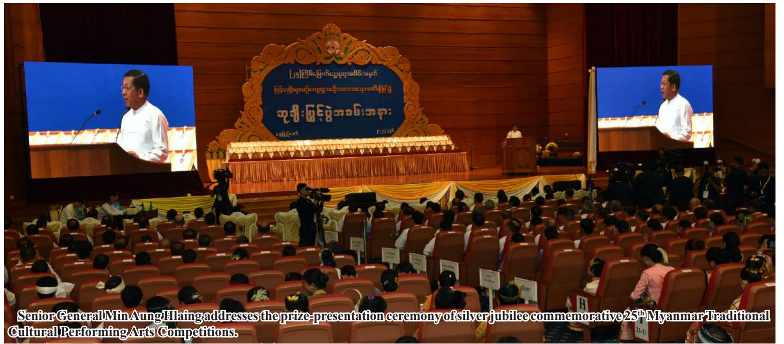
Senior General Min Aung Hlaing addresses the prize-presentation ceremony of silver jubilee commemorative 25 th Myanmar Traditional Cultural Performing Arts Competitions.

Marionette and drama contests of the Competitions could revitalize the majestic and priceless value and essence of marionette and drama. It is a satisfactory result of the Competitions, especially, the scene of young artists enthusiastically playing and singing the songs composed by great composers of the ancient times has enhanced the nationalistic fervour.