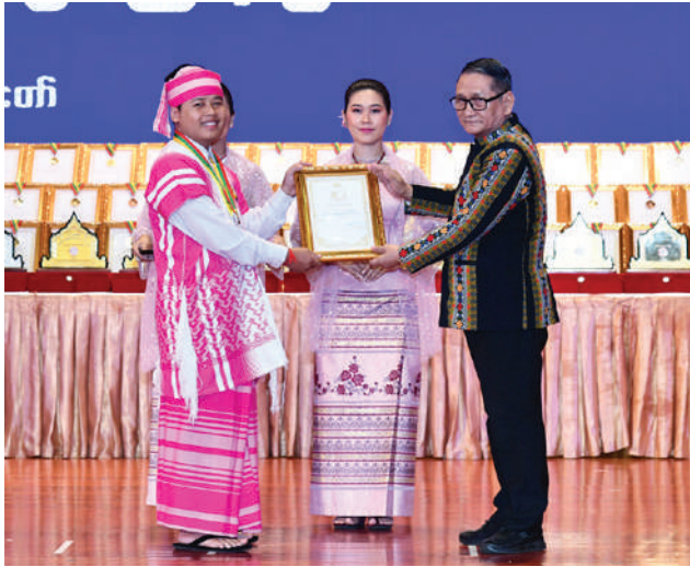
နိုင်ငံတော်စီမံအုပ်ချုပ်ရေးကောင်စီအဖွဲ့ဝင် ဒေါက်တာမူထန် အမျိုးဂုဏ်၊ ဇာတိဂုဏ်မြှင့်တင်ရေးတေးသီချင်းအဆိုပြိုင်ပွဲ ဝါသနာရှင် အဆင့် (ဒုတိယတန်း) အမျိုးသားပြိုင်ပွဲတွင် ဆုရရှိသူတစ်ဦးကို ဂုဏ်ပြု ဆုတံဆိပ်နှင့် ဂုဏ်ပြုမှတ်တမ်းလွှာပေးအပ်ချီးမြှင့်စဉ်။