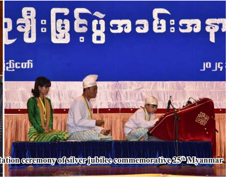
Senior General Min Aung Hlaing and wife Daw Kyu Kyu Hla watch a performance at the prize-presentation ceremony of silver jubilee commemorative 25 th Myanmar Traditional Cultural Performing Arts Competitions.

Nay Pyi Taw October 23 The prize-presentation ceremony of the silver jubilee commemorative 25th Myanmar Traditional Cultural Performing Arts Competitions was held at MICC 2 here this morning, addressed by Chairman of State Administration Council Prime Minister Senior General Min Aung Hlaing.