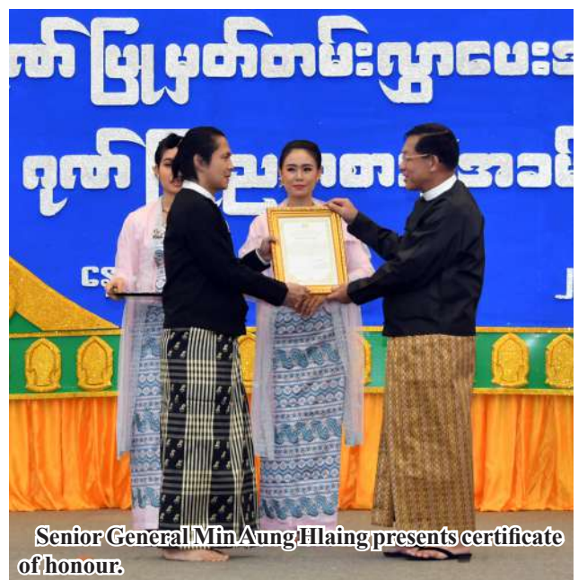
Senior General Min Aung Hlaing presents certificate of honour.

nationalistic meaningfulness and implementation of their objectives, the competitions are annually organized without breaking with tradition. On behalf of the State, I would like to solemnly express my gratitude to veteran artistes for their invaluable artistic assistance in the competitions.