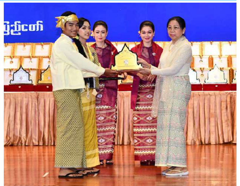
နိုင်ငံတော်စီမံအုပ်ချုပ်ရေးကောင်စီဥက္ကဋ္ဌ နိုင်ငံတော်ဝန်ကြီးချုပ် ဗိုလ်ချုပ်မှူးကြီး မင်းအောင်လှိုင်၏ ဇနီး ဒေါ်ကြူကြူလှ တနင်္သာရီတိုင်းဒေသကြီးမှ ကျေးလက်ရိုးရာ ယဉ်ကျေးမှုအဖွဲ့အား ဂုဏ်ပြုဆုပေးအပ်ချီးမြှင့်စဉ်။