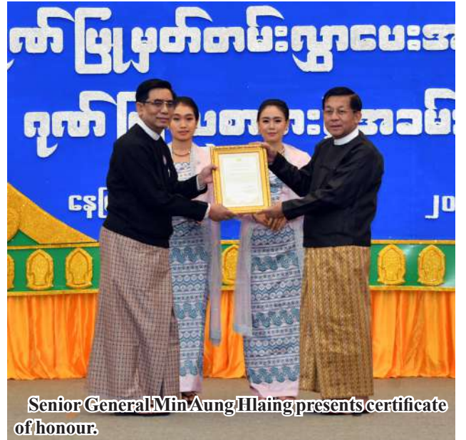
Senior General Min Aung Hlaing presents certificate of honour.

Nay Pyi Taw October 23 A ceremony to present certificates of honour and dinner commemorating the Silver Jubilee 25th Anniversary Traditional Cultural Performing Arts Competition were held at the Myanmar International Convention Centre- 2 in Nay Pyi Taw this evening and Chairman of the State Administration Council Prime Minister Senior General Min Aung Hlaing attended the ceremony and dinner.