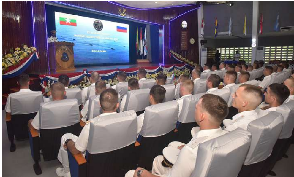
ဒုတိယအကြိမ် မြန်မာ-ရုရှား ရေကြောင်းလုံခြုံရေးဆိုင်ရာ လေ့ကျင့်ခန်း ဖွင့်ပွဲ အခမ်းအနား ကျင်းပစဉ်။

နေပြည်တော် အောက်တိုဘာ ၂၃ - ဒုတိယအကြိမ် မြန်မာ-ရုရှား ရေကြောင်းလုံခြုံရေးဆိုင်ရာ လေ့ကျင့်ခန်း ဖွင့်ပွဲအခမ်းအနားကို အောက်တိုဘာ ၂၂ ရက် နေ့လယ်ပိုင်းတွင် ရေတပ်လေ့ကျင့်ရေးဌာနချုပ် သီရိမဟာဇေယျကျော်ထင် ခန်းမ၌ကျင်းပပြုလုပ်ခဲ့ရာ တပ်မတော် (ရေ)နှင့် ရုရှားရေတပ်မှ အရာရှိကြီးများ၊ မြန်မာနိုင်ငံဆိုင်ရာ ရုရှားစစ်သံမှူးနှင့် ဆောင်ရွက်ရန်နှင့် ချစ်ကြည်ရေးခရီး လည်ပတ်ရန်ရောက်ရှိနေသော ရုရှား ရေတပ် Russian Pacific Fleet မှ စစ်ရေယာဉ် လေးစီးတို့သည် ယနေ့နံနက်ပိုင်း တွင် ရန်ကုန်မြို့ သီလဝါဆိပ်ကမ်းမှ ပြန်လည်ထွက်ခွာရာ တပ်မတော်(ရေ)မှ အရာရှိကြီးများ၊ အရာရှိ၊ စစ်သည်များ၊ မြန်မာနိုင်ငံဆိုင်ရာ ရုရှားစစ်သံမှူးနှင့်