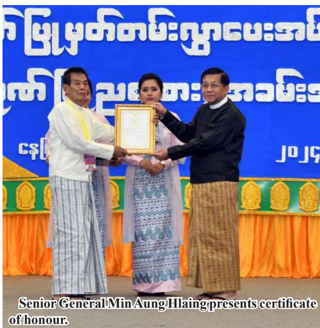
Senior General Min Aung Hlaing presents certificate of honour.