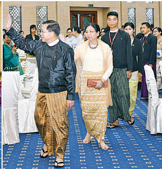
နိုင်ငံတော် စီမံအုပ်ချုပ်ရေး ကောင်စီဥက္ကဋ္ဌ နိုင်ငံတော်ဝန်ကြီးချုပ် ဗိုလ်ချုပ်မှူးကြီး မင်းအောင်လှိုင်နှင့် ဇနီး ဒေါ်ကြူကြူလှ သီဆိုဖျော်ဖြေခဲ့ကြသည့် အနုပညာရှင်များအား ရင်းရင်းနှီးနှီး နှုတ်ဆက်စဉ်။