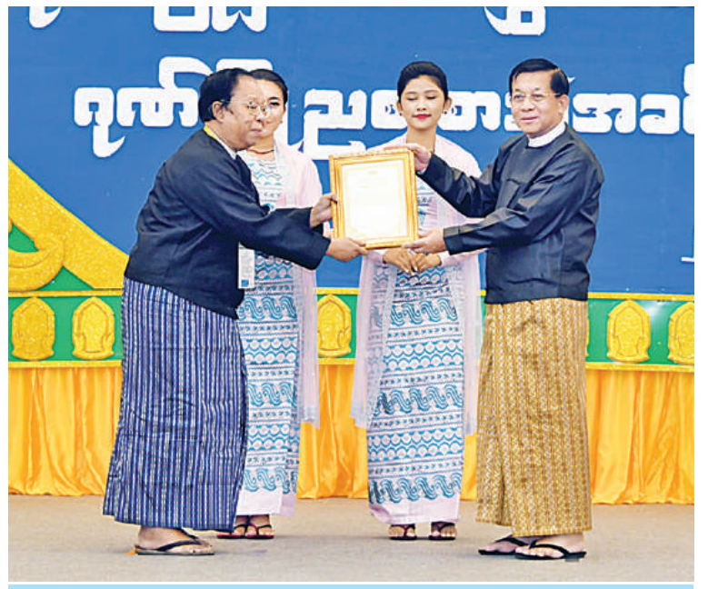
နိုင်ငံတော်စီမံအုပ်ချုပ်ရေးကောင်စီဥက္ကဋ္ဌ နိုင်ငံတော်ဝန်ကြီးချုပ် ဗိုလ်ချုပ်မှူးကြီးမင်းအောင်လှိုင် အကအကဖြတ်လုပ်ငန်းအဖွဲ့ကိုယ်စား ဥက္ကဋ္ဌ ဦးအောင်တင်ဝင်းအား ဂုဏ်ပြုမှတ်တမ်းလွှာပေးအပ်ချီးမြှင့်စဉ်။

စေတနာအပြည့်အဝဖြင့် ပါဝင်ကူညီပံ့ပိုးပေးခဲ့ကြသည့် ဝါရင့်သမ္ဘာ့ရင့် အနုပညာရှင်ကြီးများ၊ ဗဟို၊ တိုင်းဒေသကြီးနှင့် ပြည်နယ်များမှ အကဖြတ်အဖွဲ့ဝင် အနုပညာရှင်များအားလုံးကို နိုင်ငံတော်စီမံအုပ်ချုပ်ရေးကောင်စီက ဂုဏ်ပြုကျင်းပသည့် အခမ်းအနားပင်ဖြစ်ကြောင်း။ ယခုပြိုင်ပွဲကြီးများကို နှစ်စဉ် အစဉ်အလာမပျက် အသွင်သဏ္ဍာန်သာမက အနှစ်သာရပါပိုမိုပြည့်စုံပြီး အမျိုးသားရေး