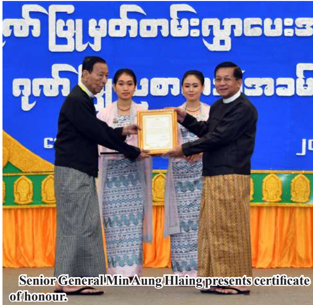
Senior General Min Aung Hlaing presents certificate of honour.