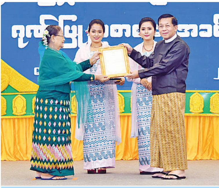
နိုင်ငံတော်စီမံအုပ်ချုပ်ရေးကောင်စီဥက္ကဋ္ဌ နိုင်ငံတော်ဝန်ကြီးချုပ် ဗိုလ်ချုပ်မှူးကြီးမင်းအောင်လှိုင် အဆိုအကဖြတ်လုပ်ငန်းအဖွဲ့ကိုယ်စား ဥက္ကဋ္ဌ ဒေါ်သင်းသင်းမြတ်အား ဂုဏ်ပြုမှတ်တမ်းလွှာပေးအပ်ချီးမြှင့်စဉ်။

အခမ်းအနားတွင် နိုင်ငံတော်စီမံအုပ်ချုပ်ရေးကောင်စီဥက္ကဋ္ဌ နိုင်ငံတော်ဝန်ကြီးချုပ်က ဂုဏ်ပြုအမှာစကားပြောကြားရာ၌ ယခုကျင်းပပြုလုပ်သည့် အခမ်းအနားသည် (၂၅)ကြိမ်မြောက် ငွေရတုအထိမ်းအမှတ် မြန်မာ့ရိုးရာယဉ်ကျေးမှု အဆို၊ အက၊ အရေး၊ အတီးပြိုင်ပွဲကြီးအောင်မြင်စွာပြီးစီးရေးအတွက် မိမိတို့၏ ကိုယ်စွမ်းဉာဏ်စွမ်းရှိသမျှ မေတ္တာ၊