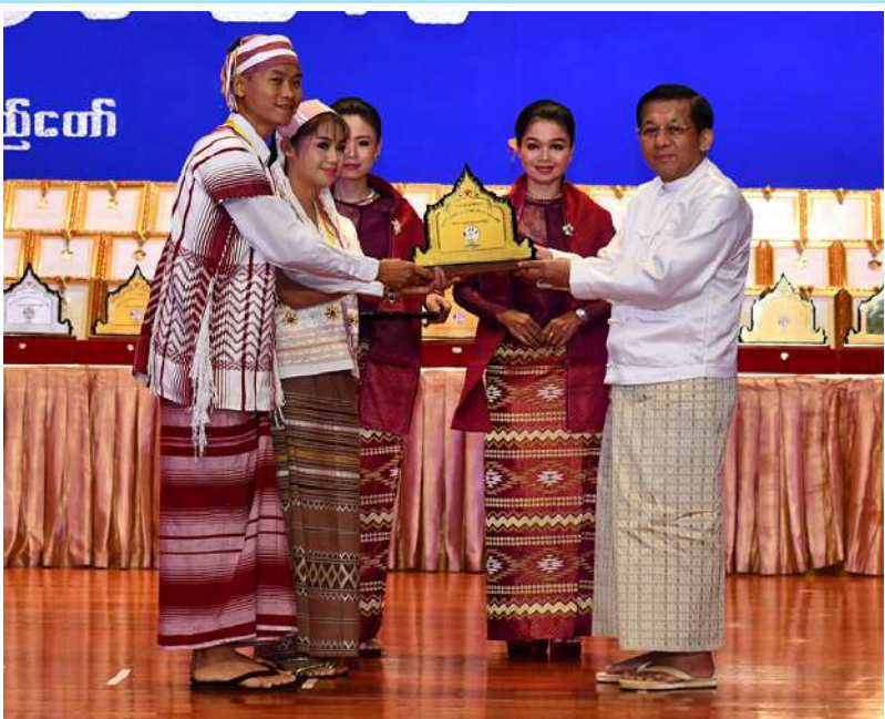
နိုင်ငံတော်စီမံအုပ်ချုပ်ရေးကောင်စီဥက္ကဋ္ဌ နိုင်ငံတော်ဝန်ကြီးချုပ် ဗိုလ်ချုပ်မှူးကြီး မင်းအောင်လှိုင် ကရင်ပြည်နယ်တိုင်းရင်းသားရိုးရာအကအဖွဲ့အား ဂုဏ်ပြုဆုပေးအပ် ချီးမြှင့်စဉ်။

အတွက် အနုပညာစွမ်းပကားဖြင့် ဆက်လက် ထိန်းသိမ်းကာကွယ် စောင့်ရှောက်သွားကြပါ ဟု အနုပညာရှင်ကြီးများနှင့်အတူ မျိုးဆက် သစ်အနုပညာရှင်များအားလုံးကို အလေးထား တိုက်တွန်းမှာကြားလိုကြောင်း။ သက်ဆိုင်ရာ တာဝန်ရှိသူများနှင့် အနုပညာရှင်များအားလုံးကို မှာကြားလိုသည် မှာ ပြည်ထောင်စုမြန်မာနိုင်ငံတော်ကြီး နိုင်ငံတကာအလယ်တွင် ဝင့်ဝင့်ထည်ထည် နှင့် ကမ္ဘာတည်သရွေ့တည်တံ့ခိုင်မြဲစေရန် အတွက် မြန်မာလူမျိုးတို့၏ ကိုယ်ပိုင် ယဉ်ကျေးမှု၊ ကိုယ်ပိုင်အနုပညာနှင့် ကိုယ်ပိုင် အမျိုးသားရေးစရိုက် လက္ခဏာများကို ဆက်လက် ရှင်သန်ထွန်းကားနေအောင် စွမ်းဆောင်ပေးကြရန်၊ နှစ်ပေါင်းထောင်ချီပြီး ခမ်းနားထည်ဝါစွာ ဖွံ့ဖြိုးစည်ပင်ခဲ့သည့် မြန်မာ့ရိုးရာယဉ်ကျေးမှု အနုပညာစစ်စစ်ကို မြတ်နိုးထိန်းသိမ်းရင်း မြန်မာတို့၏အမျိုး ဂုဏ်၊ ဇာတိဂုဏ်အစဉ်ထာဝရနိုးကြား ရှင်သန် နေစေရန် အနုပညာစွမ်းပကားဖြင့် ပူးပေါင်း