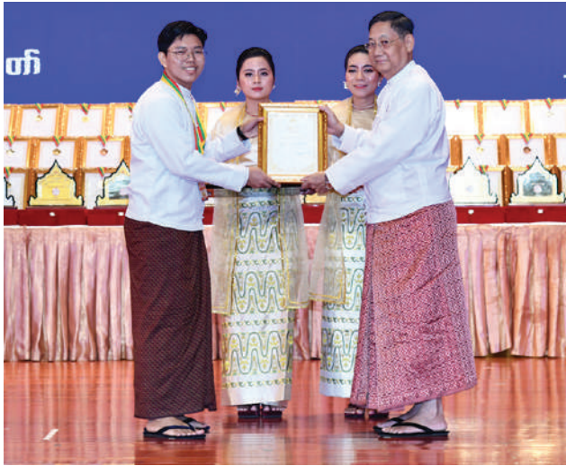
နိုင်ငံတော်စီမံအုပ်ချုပ်ရေးကောင်စီအဖွဲ့ဝင် ဒေါက်တာဘရွှေ အမျိုးဂုဏ်၊ ဇာတိဂုဏ်မြှင့်တင်ရေးတေးသီချင်းအဆိုပြိုင်ပွဲ အဆင့်မြင့် ပညာအဆင့် အမျိုးသားပြိုင်ပွဲတွင် ဆုရရှိသူတစ်ဦးကို ဂုဏ်ပြုဆုတံဆိပ် နှင့် ဂုဏ်ပြုမှတ်တမ်းလွှာပေးအပ်ချီးမြှင့်စဉ်။