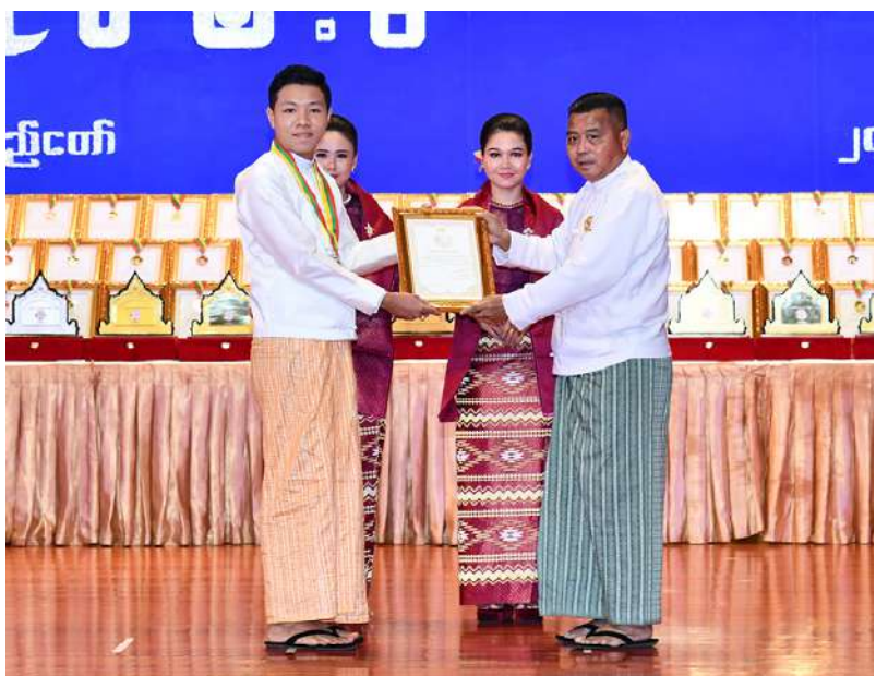
နိုင်ငံတော်စီမံအုပ်ချုပ်ရေးကောင်စီတွဲဖက်အတွင်းရေးမှူး ဗိုလ်ချုပ်ကြီးရဲဝင်းဦး မဟာဂီတအဆိုပြိုင်ပွဲ အမျိုးသားပြိုင်ပွဲ ဝါသနာရှင်အဆင့်၌ ဆုရရှိသူတစ်ဦးကို ဂုဏ်ပြုဆု တံဆိပ်နှင့် ဂုဏ်ပြုမှတ်တမ်းလွှာပေးအပ်ချီးမြှင့်စဉ်။