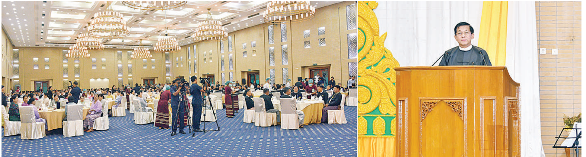
နိုင်ငံတော်စီမံအုပ်ချုပ်ရေးကောင်စီဥက္ကဋ္ဌ နိုင်ငံတော်ဝန်ကြီးချုပ် ဗိုလ်ချုပ်မှူးကြီးမင်းအောင်လှိုင် (၂၅)ကြိမ်မြောက် ငွေရတုအထိမ်းအမှတ် မြန်မာ့ရိုးရာယဉ်ကျေးမှု အဆို၊ အက၊ အရေး၊ အတီးပြိုင်ပွဲ ဂုဏ်ပြုမှတ်တမ်းလွှာ ပေးအပ်ပွဲနှင့် ဂုဏ်ပြုညစာစားပွဲအခမ်းအနားတွင် ဂုဏ်ပြုအမှာစကားပြောကြားစဉ်။

နေပြည်တော် အောက်တိုဘာ ၂၃ (၂၅)ကြိမ်မြောက် ငွေရတုအထိမ်းအမှတ် မြန်မာ့ရိုးရာယဉ်ကျေးမှု အဆို၊ အက၊ အရေး၊ အတီးပြိုင်ပွဲ ဂုဏ်ပြုမှတ်တမ်းလွှာပေးအပ်ပွဲနှင့် ဂုဏ်ပြုညစာစားပွဲအခမ်းအနားကို ယနေ့ညနေပိုင်းတွင် နေပြည်တော်ရှိ မြန်မာအပြည်ပြည်ဆိုင်ရာ ကွန်ဗင်းရှင်းဗဟိုဌာန-၂၅၅ ကျင်းပရာ နိုင်ငံတော်စီမံအုပ်ချုပ်ရေးကောင်စီဥက္ကဋ္ဌ နိုင်ငံတော်ဝန်ကြီးချုပ် ဗိုလ်ချုပ်မှူးကြီးမင်းအောင်လှိုင် တက်ရောက်ချီးမြှင့်သည်။ ဦးစွာ နိုင်ငံတော်စီမံအုပ်ချုပ်ရေးကောင်စီဥက္ကဋ္ဌ နိုင်ငံတော်ဝန်ကြီးချုပ်၊ ဇနီးနှင့် အခမ်းအနားတက်ရောက်လာကြသူများအား တိုင်းရင်းသားရိုးရာအကအဖွဲ့များက ရိုးရာယဉ်ကျေးမှုအကအလှများဖြင့် ကြိုဆိုကြသည်။