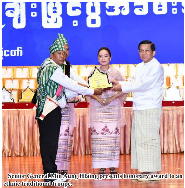
Senior General Min Aung Hlaing presents honorary award to an ethnic traditional troupe.