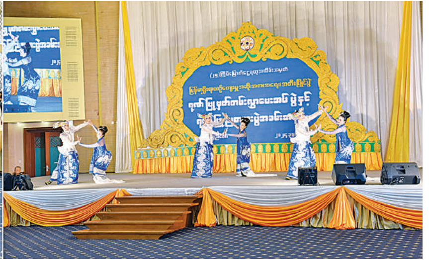
နိုင်ငံတော်စီမံအုပ်ချုပ်ရေးကောင်စီဥက္ကဋ္ဌ နိုင်ငံတော်ဝန်ကြီးချုပ် ဗိုလ်ချုပ်မှူးကြီးမင်းအောင်လှိုင်၊ ဇနီး ဒေါ်ကြူကြူလှနှင့် အခမ်းအနားတက်ရောက်လာကြသူများက အနုပညာရှင်များ၏ တေးသံသာများဖြင့် သီဆိုကပြဖျော်ဖြေမှုများကို ကြည့်ရှုအားပေးစဉ်။