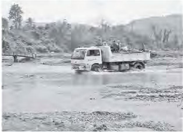
ကောက်ပဲသီးနှံများ အချိန်မီသယ်ယူပေးစဉ်

ထောက်ပံ့ကြေးကိစ္စများ ဖော်ပြပါဦးမည်။ အိမ်ဟောင်းအမျိုးအစားများကို မှတ်တမ်းတင်ထားပြီးဖြစ်ရာ အိမ် အားလုံးကို အသေးစိတ်စာတိပုံနှင့် မှတ်ချက်များ တိုက်ဆိုင်ကြည့်သည်။