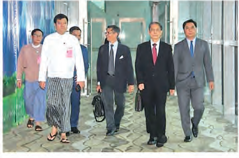
(သတင်းစဉ်)

ထွက်ခွာသွားသည်။ အဆိုပါမြန်မာကိုယ်စားလှယ်အဖွဲ့အား နိုင်ငံခြားရေးဝန်ကြီး ဌာနနှင့် မြန်မာနိုင်ငံဆိုင်ရာ ကမ္ဘောဒီးယားနိုင်ငံသံရုံးမှ တာဝန် ရှိသူများက ရန်ကုန်အပြည်ပြည်ဆိုင်ရာလေဆိပ်၌ ပို့ဆောင် နှုတ်ဆက်ခဲ့ကြောင်း သတင်းရရှိသည်။