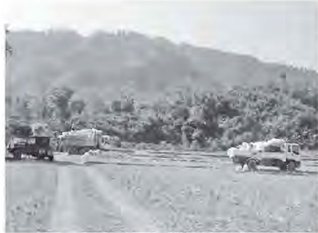
ကောက်ပဲသီးနှံများ အချိန်မီသယ်ယူပေးစဉ်

တစ်ဖက်ကလည်း ရွာသားများ၏လယ်ယာများ ရိတ်သိမ်းသယ်ယူမှု မြန်ဆန်စေရေး ဌာနပိုင်ယာဉ်များဖြင့် ရွာအလိုက်ခွဲ၍ ကူညီခဲ့ရာ ဖေဖော်ဝါရီလထဲတွင် ရိက္ခာများအားလုံး ဆိုင်ရာဆိုင်ရာနေရာသစ် အသီးသီးသို့ ရောက်သွားတော့သည်။ လယ်ယာထွက်ကုန်များသည် စုစုပေါင်းတန် ၉၀၀၀၀ ခန့်အထိ များပြားခြင်းနှင့် နေရာပြန့်ကျဲနေခြင်း၊ တောင်ပေါ်ရာသီဥတုဖြစ်၍ မိုးကလည်း မကြာမကြာရွာတတ်ခြင်း တို့ကြောင့် ကားဖြင့်သယ်ရန်ခက်ခဲပါက ထော်လာဂျီ၊ လှည်းများ၊ စက်လှေ များဖြင့် ဌာနမှစရိတ်ကျခံ၍ ရွှေ့ပြောင်းပေးခဲ့သည်။ ကျေးရွာများ ပြောင်းရွှေ့မှုမြန်ဆန်စေရေး ဌာနမှ ခုနစ်တန်နှင့်အထက်ယာဉ်ကြီး စုစုပေါင်း ၅၉ စီးအထိ သုံးစွဲခဲ့သည်။