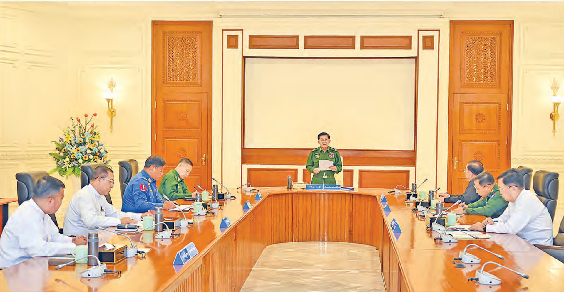
ပြည်ထောင်စုသမ္မတမြန်မာနိုင်ငံတော် အမျိုးသားကာကွယ်ရေးနှင့် လုံခြုံရေးကောင်စီအစည်းအဝေး(၂/၂၀၂၄)ကျင်းပစဉ်။