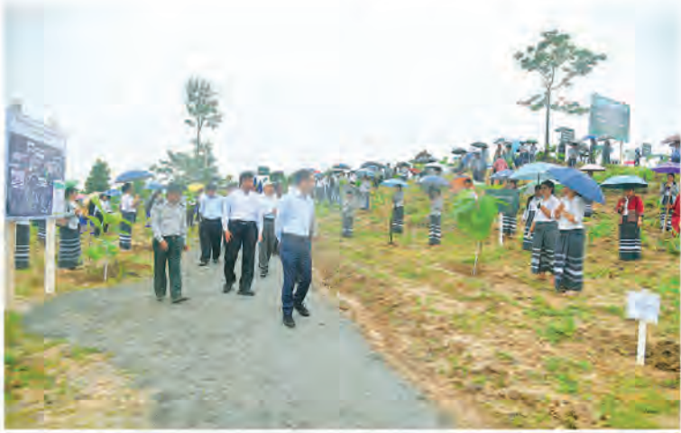
သစ်ပင်စိုက်ပျိုးပွဲအပြီးတွင် ပြည်ထောင်စု ဝန်ကြီးသည် ရုရှားဖက်ဒရေးရှင်းနိုင်ငံ ရောက်ကွန်ဂရက် ရင်းနှီးမြှုပ်နှံမှုရန်ပုံငွေအဖွဲ့ အမှုဆောင်အရာရှိချုပ် မစ္စတာအလက်စ် ဇန်းဒါး ဆာဝီးဗစ်ရှ် ရှုတီရော့ဗ် ဦးဆောင် သည့် ကိုယ်စားလှယ်အဖွဲ့ကို ပြည်ထောင်စု ဝန်ကြီးရုံး အစည်းအဝေးခန်းမ၌ လက်ခံ တွေ့ဆုံပြီး မြန်မာ - ရုရှား နှစ်နိုင်ငံအကြား ဓာတ်သတ္တု ဖွံ့ဖြိုးတိုးတက်ရေးကဏ္ဍဆိုင်ရာ ကိစ္စရပ်များ၊ နည်းပညာပူးပေါင်းဆောင်ရွက် ရေးဆိုင်ရာ ကိစ္စရပ်များနှင့်စပ်လျဉ်း၍ ရင်းနှီးပွင့်လင်းစွာဆွေးနွေးခဲ့ကြောင်း သတင်း ရရှိသည်။ (သတင်းစဉ်)

စိုက်ပျိုးပွဲများကို နေပြည်တော်နှင့် တိုင်းဒေသကြီး/ပြည်နယ်အသီးသီးတွင် နှစ်စဉ်ကျင်းပလျက်ရှိရာ ယခုနှစ်တွင် လူထုလှုပ်ရှားမှုအသွင်ဖြင့် သစ်ပင်စိုက်ပျိုးပွဲ အကြိမ် ၃၉၀ သစ်ပင်ပေါင်း ၃၁၅၀၀၀ ကျော် စိုက်ပျိုးခဲ့ပြီးဖြစ်သည်။ ဝန်ကြီးဌာန အနေဖြင့် ၂၀၂၄ ခုနှစ် မိုးရာသီအတွင်း သစ်တောစိုက်ခင်း၊ ဒီရေတောစိုက်ခင်း၊ ရေဝေရေလဲစိုက်ခင်းနှင့် ကျေးရွာထင်း စိုက်ခင်းများတည်ထောင်ခြင်း၊ ကားလမ်း ဘေးဝဲ/ယာ စိုက်ပျိုးခြင်း၊ စုပေါင်းသစ်ပင် စိုက်ပျိုးပွဲနှင့်လူထုဖြန့်ဖြူးပျံ့နှံ့ခြင်းများတွင် သစ်ပင်စုစုပေါင်း ၂၁ ဒသမ ၂၂ သန်း စိုက်ပျိုး ပြီးစီးပြီဖြစ်ကြောင်း သိရသည်။