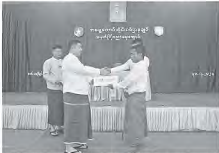
မွန်ပြည်နယ်ဝန်ကြီးချုပ် ဦးအောင်ကြည်သိန်း ပြည်သူ့စစ်မှုထမ်းသင်တန်းအမှတ်စဉ်(၄/၂၀၂၄) သို့ တက်ရောက်မည့် နိုင်ငံသားကောင်းရတနာများအား ဂုဏ်ပြုချီးမြှင့်ပေးအပ်စဉ်။

ထိုသို့တွေ့ဆုံရာတွင် ပြည်သူ့စစ်မှုထမ်းသင်တန်းအမှတ်စဉ်(၄/၂၀၂၄)သို့ တက်ရောက်မည့် နိုင်ငံသားကောင်းရတနာများအား ဂုဏ်ပြုချီးမြှင့်ပေးအပ်ပြီး ပြည်နယ်ဝန်ကြီးချုပ်၊ တိုင်းမှူးနှင့် တာဝန်ရှိသူများက သင်တန်းသားများနှင့် ရင်းရင်းနှီးနှီးတွေ့ဆုံအားပေးစကားပြောကြားကာ လိုအပ်သည်များ ပေါင်းစပ်ညှိနှိုင်းဆောင်ရွက်ပေးခဲ့သည်။