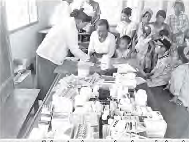
ကျေးရွာများပြောင်းရွှေ့ဆဲ ကျန်းမာရေးစောင့်ရှောက်မှု ဆောင်ရွက်ပေးစဉ်

သို့သော် လယ်၊ ယာ၊ ကိုင်း၊ ဥယျာဉ်ခြံနှင့်တကွ တခြားနှစ်ရှည်ပင်မျိုးစုံ ကို ဈေးနှုန်းသတ်မှတ်ရေးကိစ္စမှာ ခက်ခဲသည်။ ဒေသပေါက်ဈေးရှိသည် ဟုဆိုသော်လည်း ဒေသကွဲလွဲမှု၊ မြေအခြေအနေကွဲလွဲမှု၊ အပင်အရွယ်