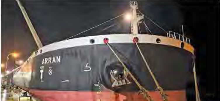
ဆိပ်ကမ်း၌ဆိုက်ကပ်ထားသည့် စက်သုံးဆီတင်သင်္ဘောတစ်စင်းကိုတွေ့ရစဉ်။

မြှင့်တင်၍ တစ်ဆင့်ပြန်လည်ရောင်းချခြင်းတို့ကို မပြုလုပ်ကြပါရန်၊ သုံးစွဲရန်လိုအပ်သည့်ပမာဏကိုသာ ဝယ်ယူသုံးစွဲကြပါရန်၊ အရောင်းဆိုင်များကိုလည်း စက်သုံးဆီရိုလျက် ရောင်းချပေးခြင်းမျိုးမပြုလုပ်ကြစေရေး စနစ်တကျစီစဉ်ကြပ်မတ်လျက်ရှိပါကြောင်းနှင့် လက်ရှိအခြေအနေများအရ စက်သုံးဆီပြတ်လပ်နိုင်မှု မရှိနိုင်ကြောင်း သတင်းရရှိပါသည်။ (၁၀၀)