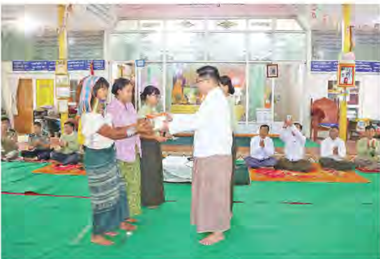
စကား ပြောကြားခဲ့ပြီး ဆန်၊ ဆီ၊ ခေါက်ဆွဲခြောက်နှင့် ထောက်ပံ့ငွေပေးအပ်ကာ ပြည်သူများ၏ တင်ပြချက်များအပေါ် လိုအပ်သည်များ ကူညီဖြည့်ဆည်းဆောင်ရွက်ပေးခဲ့သည်။ ၎င်းနောက် ပြည်နယ်ပြည်သူ့ကျန်းမာရေးဦးစီးဌာန ဝန်ထမ်းများက ယာယီနေရပ်စွန့်ခွာပြည်သူများအား ကျန်းမာရေးစောင့်ရှောက်မှုပေးနေမှုအား ကြည့်ရှုအားပေးခဲ့ပြီး နေရပ်စွန့်ခွာပြည်သူများ အဆင်ပြေစွာနေထိုင်နိုင်ရေး လိုအပ်သည်များညှိနှိုင်းဆောင်ရွက်ပေးခဲ့ကြောင်း သိရသည်။ (ပြည်နယ်(ပြန်/ဆက်))

ဘွန်းကျေးရွာတို့မှ ယာယီနေရပ်စွန့်ခွာပြည်သူများအား ရင်းရင်းနှီးနှီးတွေ့ဆုံအားပေးစကားပြောကြားပြီး ဆန်၊ ဆီ၊ ခေါက်ဆွဲခြောက်နှင့် ထောက်ပံ့ငွေများ ပေးအပ်ကာ ပြည်သူများ၏တင်ပြချက်များအပေါ်တွင် လိုအပ်သည်များကူညီဖြည့်ဆည်းဆောင်ရွက်ပေးခဲ့သည်။ ဆက်လက်၍ ပြည်နယ်ဝန်ကြီးချုပ်နှင့် တာဝန်ရှိသူများသည် လွိုင်ကော်မြို့ တောင်တန်းသာသနာပြုဗဟိုတပ်ဦးကျောင်းသို့ သွားရောက်ခဲ့ပြီး ပန်ကန်းကျေးရွာနှင့် ထူဒူင်သကျေးရွာတို့မှ ယာယီနေရပ်စွန့်ခွာပြည်သူများအား ရင်းရင်းနှီးနှီးတွေ့ဆုံအားပေး