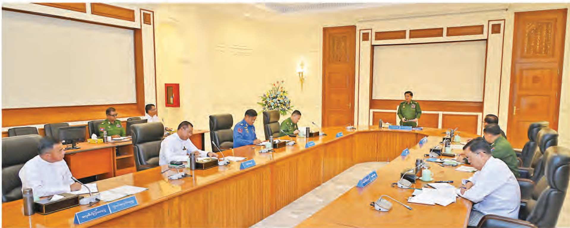
National Defence and Security Council Meeting 2/2024 in progress.

The National Defence and Security Council of the Republic of the Union of Myanmar held meeting No 2/2024 at the Office of the State Administration Council Chairman in Nay Pyi Taw this morning.