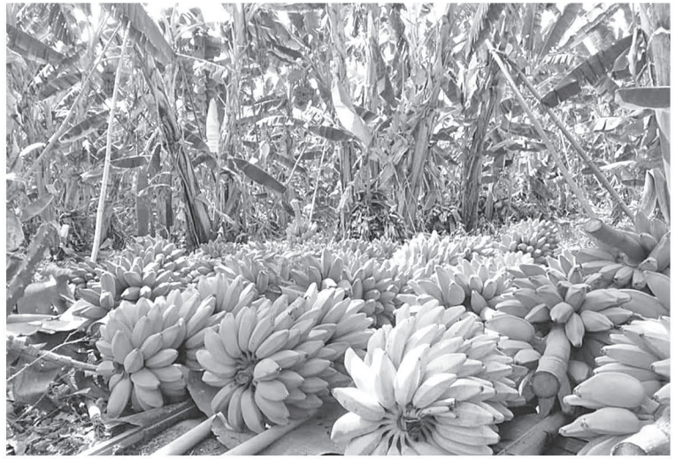
အချို့တောင်သူများက သီးနှံဝင်ငွေ ပိုမိုရရှိစေရန် ဖီးကြမ်းငှက်ပျော၊ ငှက်ပျောချဉ်၊ သီးမွှေးငှက်ပျော၊ ရခိုင်ငှက်ပျောတို့ကို တစ်နိုင်တစ်ပိုင် စိုက်ပျိုးလုပ်ကိုင်ကြကြောင်း သိရသည်။ လှိုင်ဝင်းလေး(ပွင့်ဖြူမြို့)

တောင်သူများအပြင် ဖောက်သည်ဝယ်ယူပြီး တစ်ဆင့်ပြန်ရောင်းသည့် ဈေးသည်များလည်း အလုပ်အကိုင်အဆင်ပြေလျက်ရှိကြောင်း သိရသည်။ ပွင့်ဖြူမြို့နယ်သည် စိုက်ပျိုးရေးအဆင်ပြေမှုကြောင့် ဒေသခံတောင်သူများက စိုက်ပျိုးရေးလုပ်ငန်းကို တစ်နှစ်ပတ်လုံး ဖီးပွားဖြစ်လုပ်ကိုင်ကြပြီး အဓိကစိုက်ပျိုးသည့် သီးနှံများမှာ စပါး၊ နှမ်း၊ ကုလားပဲ၊ ထောပတ်ပဲ၊ ပဲလွမ်း၊ ပဲကြီး၊ ပဲနောက်၊ ပဲတီစိမ်း၊ နေကြာ၊ မြေပဲသီးနှံနှင့် အခြားစားပင်သီးနှံမျိုးစုံတို့ကို စိုက်ပျိုးကြကြောင်း၊