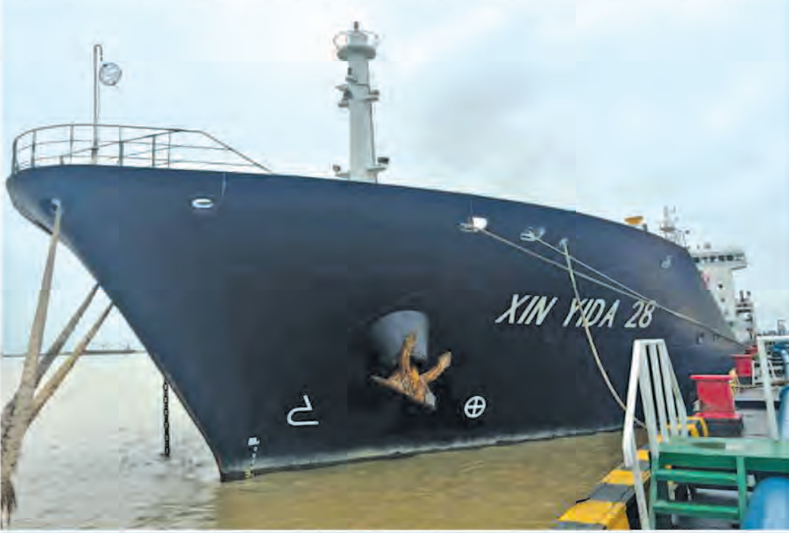
ဆိပ်ကမ်း၌ဆိုက်ကပ်ထားသည့် စက်သုံးဆီတင်သင်္ဘောတစ်စင်းကိုတွေ့ရစဉ်။

နေပြည်တော် ၈ ဇူလိုင် ၃၁ ဇူလိုင်လလယ်ခန့်မှစ၍ မိုးအဆက်မပြတ် ရွာသွန်းပြီး ဒေသအချို့တွင် ရေကြီးရေလျှံမှု များဖြစ်ပေါ်နေခြင်းကြောင့် စက်သုံးဆီ တင်သွင်းသို့လှောင်ဖြန့်ဖြူးခြင်းလုပ်ငန်းများ ဆောင်ရွက်နေသည့် သီလဝါဆိပ်ကမ်းဒေသ ရှိ Terminal များ၏ ပုံမှန်လုပ်ငန်းဆောင် ရွက်မှုများအနည်းငယ်နှောင့်နှေးကြန့်ကြာ ခြင်း၊ သယ်ယူပို့ဆောင်ရာတွင်လည်း လမ်း ခရီးအခြေအနေများအရ အချို့ဒေသများ သို့ ဆီတင်ယာဉ်ရောက်ရှိရန် အချိန်အနည်း ငယ်ကြန့်ကြာခြင်းတို့ကြောင့် အရောင်းဆိုင် အချို့တွင် ဆီတင်ယာဉ်မရောက်မီ စက်သုံး ဆီအမယ်အချို့ ယာယီပြတ်လပ်မှုဖြစ်ပေါ် စေရေး စနစ်တကျစစ်ဆေးသိမ်းဆည်းချ စေလျက်ရှိသည့်အပြင် လိုအပ်ပါက Urgent အစီအစဉ်ဖြင့် ဖြည့်တင်းပေးခြင်း၊ ရေကြီး ရေလျှံမှုကြောင့် ယာယီပိတ်သိမ်းထားသော အရောင်းဆိုင်များသို့ပေးပို့နေသည့် စက်သုံး ဆီများအား လိုအပ်သည့်အရောင်းဆိုင်များ သို့ စာမျက်နှာ ၂၇ ကော်လံ ၁ ▶▶