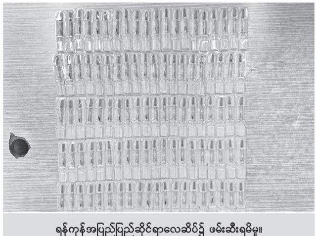
ရန်ကုန်အပြည်ပြည်ဆိုင်ရာလေဆိပ်၌ ဖမ်းဆီးရမိမှု။