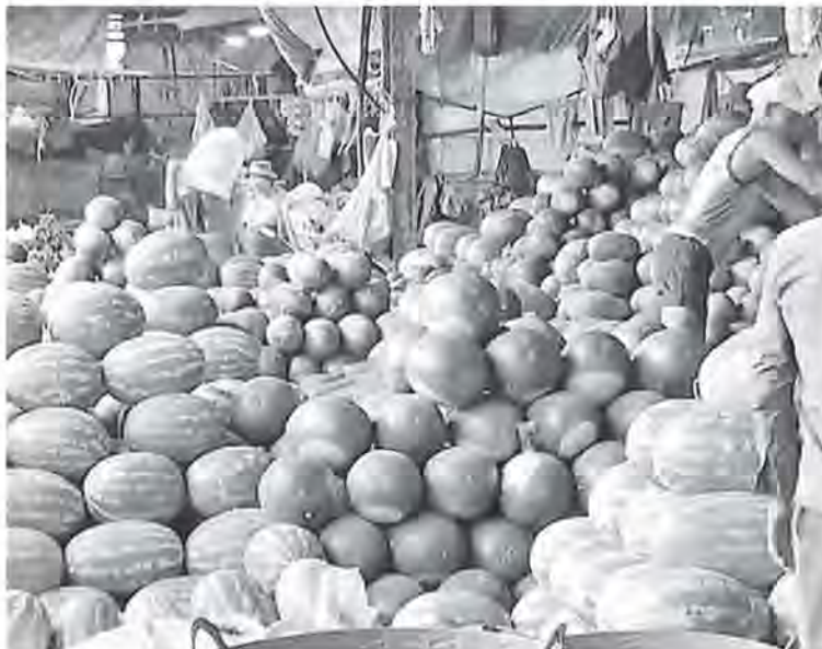
ဆောင်းဦး

ထို့ပြင် သီရိမင်္ဂလာဈေး၌ CCTV ကင်မရာအလုံး ၁၀၀ ကျော်တပ်ဆင်ထား ပြီး ၂၄ နာရီစောင့်ကြည့်ကာ ထူးခြားဖြစ်စဉ် များမဖြစ်ပေါ်စေရန် စောင့်ကြပ်လျက် ရှိကြောင်း၊ လက်ရှိ သီရိမင်္ဂလာဈေးသို့ တစ်ရက်လျှင် ကုန်တင်ယာဉ်အစီးရေ ၃၅၀ ခန့် ဝင်ထွက်လျက်ရှိကြောင်း သိရသည်။ ဈေးအတွင်း ရောင်းဝယ်ဖောက်ကား ချိန်ကို နံနက် ၄ နာရီမှ ည ၇ နာရီအထိ သတ်မှတ်ထားပြီး ယင်းအချိန်နောက်ပိုင်း တွင် ကုန်စည်ပစ္စည်းများတင်ဆောင်လာ သော ကုန်တင်ယာဉ်များ ရောက်ရှိလာ ပါကလည်း ဝင်ရောက်ခွင့်ပြုထားကြောင်း သိရသည်။