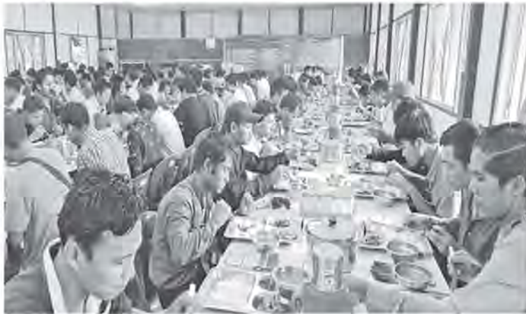
ရန်ကုန်တိုင်းဒေသကြီး လှည်းကူးမြို့နယ်ရှိ နယ်မြေခံသင်တန်းကျောင်း၌ ပြည်သူ့စစ်မှုထမ်းသင်တန်းအမှတ်စဉ်(၄/၂၀၂၄) သို့ တက်ရောက်မည့် နိုင်ငံသားကောင်းရတနာများအား နေ့လယ်စာဖြင့် တည်ခင်းဆွေးနွေးစဉ်။

မွန်ပြည်နယ်အတွင်းမှ ပြည်သူ့စစ်မှုထမ်းသင်တန်း အမှတ်စဉ် (၄/၂၀၂၄) သို့ တက်ရောက်မည့် နိုင်ငံသားကောင်းရတနာများအား ယနေ့တွင် မော်လမြိုင်မြို့ရှိ နယ်မြေခံသင်တန်းကျောင်း၌ ပြည်နယ်ဝန်ကြီးချုပ် ဦးအောင်ကြည်သိန်းနှင့် အရှေ့တောင်တိုင်းစစ်ဌာနချုပ် တိုင်းမှူး ဗိုလ်မှူးချုပ်ကျော်လင်းမောင်နှင့် တာဝန်ရှိသူများက သွားရောက်တွေ့ဆုံအမှာစကားပြောကြားသည်။