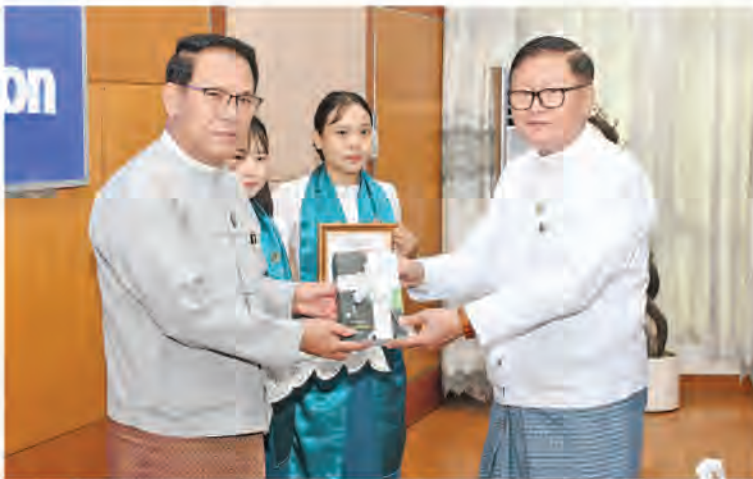
စိုက်ပျိုးရေး၊ မွေးမြူရေးနှင့် ဆည်မြောင်း ဝန်ကြီးဌာန ဒုတိယဝန်ကြီး ဒေါက်တာ အောင်ကြီး (စာရေးဆရာမောင်အောင်) က ပြန်ကြားရေးဝန်ကြီးဌာနရှိ ရုံးစာကြည့်တိုက်များနှင့် စာကြည့်တိုက်ကော်မတီအတွက် စာအုပ်များပေးအပ်လှူဒါန်းပွဲကို ယနေ့

နံနက်ပိုင်းတွင် နေပြည်တော်ရှိ ပြန်ကြားရေး ဝန်ကြီးဌာနအစည်းအဝေးခန်းမ၌ ကျင်းပ သည်။ အခမ်းအနားသို့ ပြည်ထောင်စုဝန်ကြီး ဦးမောင်မောင်အုန်း၊ ဒုတိယဝန်ကြီး ဦးရဲတင့်၊ အမြဲတမ်းအတွင်းဝန် ဦးဝင်းကျော်အောင်၊ ဌာနဆိုင်ရာအကြီးအကဲများနှင့်တာဝန်ရှိသူ များတက်ရောက်ကြသည်။ ဦးစွာ ဒုတိယဝန်ကြီး ဒေါက်တာအောင်ကြီး က ယခုစာအုပ်သည် ၁၉၇၃ ခုနှစ် တက္ကသိုလ် ကျောင်းသားဘဝ တတိယနှစ်တွင် ရေးသား ခဲ့သည့်စာအုပ်ဖြစ်ပါကြောင်း၊ ယင်းစာအုပ် သည် စာပေဗိမာန်ဆုရရှိခဲ့ပြီး ၂၀၁၉ ခုနှစ် တွင် ဒုတိယအကြိမ်ထုတ်ဝေခဲ့ပါကြောင်း၊