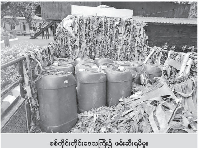
စစ်ကိုင်းတိုင်းဒေသကြီး၌ ဖမ်းဆီးရမိမှု။

တရားမဝင်ကုန်သွယ်မှုတိုက်ဖျက်ရေး ဦးဆောင်ကော်မတီ၏ ကြီးကြပ်ကွပ်ကဲမှုဖြင့် တရားမဝင်ကုန်သွယ်မှုများကို ဥပဒေနှင့် အညီ ထိရောက်စွာတားဆီးအရေးယူနိုင်ရေး ဆောင်ရွက်လျက်ရှိရာ ဇူလိုင်လ ၂၉ ရက် တွင် အကောက်ခွန်ဦးစီးဌာန၏စီမံခန့်ခွဲမှု ဖြင့် တာဝန်ကျပူးပေါင်းအဖွဲ့များက စစ်ဆေးမှုများဆောင်ရွက်ခဲ့ရာ ရန်ကုန် အပြည်ပြည်ဆိုင်ရာလေဆိပ်၌ ခရီးသည် (၁)ဦး၏ဝန်စည်အတွင်းမှ တရားဝင် စာရွက်စာတမ်းအထောက်အထား တင်ပြနိုင် ခြင်းမရှိသည့် အိန္ဒိယနိုင်ငံထုတ်ဆေးဝါး Erythropoietin Injection IP (ထုံဆေး) (၄၅၂)ဘူး (ခန့်မှန်းတန်ဖိုးငွေကျပ် ၃၁၅၆၀၀၀)ကိုလည်းကောင်း၊ ရန်ကုန် လေဆိပ်(ကုန်လှောင်ရုံ)၌ ပိုင်ရှင်မှစွန့်လွှတ်