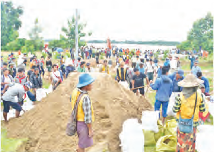
ရဲတပ်ဖွဲ့ဝင်များ၊ မီးသတ်တပ်ဖွဲ့ဝင်များ၊ လူမှု ရေးအသင်းအဖွဲ့များ၊ နေပြည်တော် MSME အသင်းမှ တာဝန်ရှိသူများ၊ စီးပွားရေး လုပ်ငန်းရှင်များ၊ ကျေးရွာနေပြည်သူများ ပိုင်းဝန်းပူးပေါင်းဆောင်ရွက်ခဲ့ကြပြီး ယနေ့ နံနက် ၈ နာရီခွဲတွင် ရေကျော်မှုကိုထိန်းနိုင် ခဲ့ပြီးဖြစ်သည်။ ထိုသို့ဆောင်ရွက်နေမှုများကို နေပြည်တော်

နေပြည်တော်ကောင်စီဥက္ကဋ္ဌ ဦးသန်း ထွန်းဦးသည် နေပြည်တော်တိုင်းစစ်ဌာနချုပ် တိုင်းမှူး ဗိုလ်ချုပ်စိုးမင်း၊ နေပြည်တော် ကောင်စီဝင်များ၊ နေပြည်တော်စည်ပင် သာယာရေးကော်မတီ ဒုတိယမြို့တော်ဝန်၊ တာဝန်ရှိသူများနှင့်အတူ ယနေ့နံနက်ပိုင်း တွင် လယ်ဝေးမြို့နယ်အတွင်းရှိ ဆင်အုံ ရေလှောင်ကန်သို့ရောက်ရှိပြီး ကန်၏ အရှေ့ဘက်ခြမ်း၌ ရေတားအဖြစ်တည်ရှိ သည့် သဘာဝကုန်းတန်းရေကျော်နေမှု အခြေအနေကို ကြည့်ရှုစစ်ဆေးသည်။ အဆိုပါ ဆင်အုံရေလှောင်ကန်သည် ယမန်နေ့ညပိုင်းက ဖြိုခွဲသွားသည့်အတွက် ယနေ့နံနက်ပိုင်းတွင် ကန်၏ အရှေ့ဘက်ခြမ်း၌ ရေတားအဖြစ်တည်ရှိ သည့် သဘာဝကုန်းတန်းရေကျော်မှုဖြစ်ပွားခဲ့ သည့်အတွက် ရေကျော်နေမှုကို စက်ယန္တရား နှစ်စီးဖြင့် နေပြည်တော်သဘာဝဘေး အန္တရာယ် စီမံခန့်ခွဲမှုကော်မတီဝင်များ၊ တိုင်း/ခရိုင်/မြို့နယ်အဆင့်ဌာနဆိုင်ရာ များ၊ တပ်မတော်သားများ၊ မြန်မာနိုင်ငံ