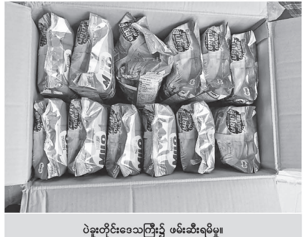
ပဲခူးတိုင်းဒေသကြီး၌ ဖမ်းဆီးရမိမှု။