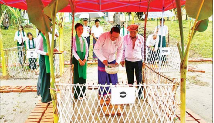
ကျောင်းစာကြည့်တိုက်အဆောက်အအုံ ပန္နက်တော်တင်မင်္ဂလာအခမ်းအနား ကျင်းပ

ဘားအံ ဇွန် ၁၆ တိုက်ယဉ်ကျေးမှု ထွန်းကားလာ အနားကို ကျင်းပသည်။ ကျောင်းသား၊ ကျောင်းသူ၊ လူငယ် စေရန် ဇွန် ၁၆ ရက် နံနက်က အဆိုပါ စာကြည့်တိုက် လူရွယ်များ ငယ်နစဉ်အရွယ်မှစ၍ ဘားအံမြို့၊ အမှတ်(၁) အခြေခံ အဆောက်အအုံကို ကရင်ပြည်နယ် အစိုးရအဖွဲ့၊ ကျေးလက်ဖွံ့ဖြိုးရေး နှင့်ဆင်းရဲမှုလျှော့ချရေး (ကလဖ) ရန်ပုံငွေကျပ်သိန်း ၁၀၀၊ Myanmar Imperial Vega Co., Ltd