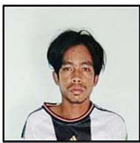
မင်းသူ(၂၀)နှစ်