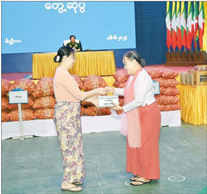
နိုင်ငံတော်စီမံအုပ်ချုပ်ရေးကောင်စီဥက္ကဋ္ဌ တပ်မတော်ကာကွယ်ရေးဦးစီးချုပ် ဗိုလ်ချုပ်မှူးကြီး မင်းအောင်လှိုင်၏ ဇနီး ဒေါ်ကြူကြူလှ မိတ္ထီလာတပ်နယ်မိခင်နှင့် ကလေးစောင့်ရှောက်ရေးအသင်းအတွက် ချီးမြှင့်ငွေများ ပေးအပ်စဉ်။

ပိုလျှံလာသည့်ငွေကြေးများကို အခြားနေရာများ၌ အသုံးပြုနိုင်မည်ဖြစ်ကြောင်း၊ တပ်ပိုင်စိုက်ပျိုးမွေးမြူ ရေးလုပ်ငန်းများကို အောင်မြင်အောင် ဆောင်ရွက်ပြီး အရာရှိ၊ စစ်သည်၊ မိသားစုဝင်များ၏ သက်သာ ချောင်ချိရေးကို အဓိကထားပြုညီဆည်းပေးနိုင်ရန် လိုကြောင်း၊ ထို့ပြင် မိမိတို့တပ်မတော်သားများ၏ စားသောက်နေထိုင်မှုမှအစ လူနေမှုအဆင့်အတန်းကို မြှင့်တင်ဆောင်ရွက်ပေးနိုင်ရမည်ဖြစ်ပြီး ရသင့် ရထိုက်သည့် ရပိုင်ခွင့်များအပြင် အခြားလိုအပ်ချက် များကို တတ်စွမ်းသရွေ့ ပြည့်ဆည်းဆောင်ရွက် ပေးရန် လိုအပ်မည်ဖြစ်ကြောင်း၊ ဦးစီးခေါင်းဆောင် များအနေဖြင့်လည်း မိမိတို့၏ လက်အောက်မှ အရာရှိ၊ စစ်သည်၊ မိသားစုများအတွက် ပတ်ဝန်းကျင် ကောင်းမွန်စေရန်နှင့် ဖန်တီးပေးနိုင်ရမည်ဖြစ်ပြီး ညီညွတ် မျှတသည့် အုပ်ချုပ်မှုပုံစံရှိရမည်ဖြစ်ကြောင်း။