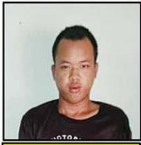
မြည့်မြိုးဇော်(၂၁)နှစ်