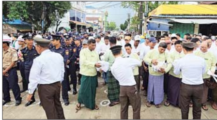
ဆက်လက်၍ ဌာနဆိုင်ရာအကြီးအကဲများနှင့် တာဝန်ရှိသူများက တက်ရောက်လာသော ပြည်သူများအား ၂၀၂၄ ခုနှစ် လူဦးရေနှင့် အိမ်အကြောင်းအရာ သန်းခေါင်စာရင်း အသိပညာပေး လက်ကမ်းစာစောင် များ တစ်ဦးချင်းလိုက်လံပေးအပ်သည်။ (အပေါ်ပုံ)