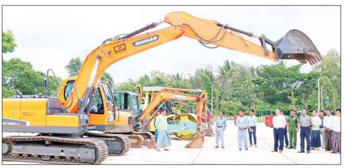
သည် ကယားပြည်နယ်အတွင်း လုပ်ငန်းများ ဆောင်ရွက်နိုင်ရေး အသုံးပြုနိုင်မှု အခြေအနေများကို မြို့များ မြို့အင်္ဂါရပ်နှင့်အညီ ဖြစ်စေ အတွက် လူနှင့် ယာဉ်စက်ယန္တရား လှည့်လည်ကြည့်ရှု စစ်ဆေးခဲ့ ရေး၊ ပြန်လည်ထူထောင်ရေး စုဖွဲ့ထားရှိမှုယာဉ်များ ကြံ့ခိုင်မှုနှင့် သည်။ ပြည်နယ် (ပြန်/ဆက်)

လျိုင်ကော် ဇွန် ၁၆ စည်ပင်သာယာရေးလုပ်ငန်းများ နှင့် ပြန်လည်ထူထောင်ရေး လုပ်ငန်းများ အရှိန်အဟုန်ဖြင့် ဆောင်ရွက်ရန်အတွက် လူအင်အားစုဖွဲ့မှု၊ ယာဉ်စက်ယန္တရားစုဖွဲ့မှုများနှင့် အုပ်ချုပ်မှုဆိုင်ရာ လိုအပ်ချက်များအတွက် ပြင်ဆင်ဆောင်ရွက်ထားရှိရန် လိုကြောင်း၊ ပြည်သူများ စိတ်အေးချမ်းသာသာ ရောင်းဝယ်ဖောက်ကားနိုင်ရေး အတွက် ဈေးအသစ်တည်ဆောက် နေစဉ်ကာလအတွင်း ယာယီဈေးအား စည်းကမ်းတကျဖြင့် အမြန်ဆုံး ဖွင့်လှစ်ရောင်းချနိုင်ရေး မှာကြားခဲ့သည်။ ထို့နောက် ခေတ္တပြည်နယ် စည်ပင်သာယာရေး အမှုဆောင် အရာရှိက စည်ပင်သာယာရေးအဖွဲ့၏ လက်ရှိစည်ပင်သာယာရေး လုပ်ငန်းများ ဆောင်ရွက်နေမှု၊ လူ/ယာဉ်ယန္တရားစုဖွဲ့ထားရှိမှုနှင့် ပြန်လည်ထူထောင်ရေး လုပ်ငန်းများ အားသွန်ခွန်စိုက်ဆောင်ရွက်နိုင်ရေး စီစဉ်ဆောင်ရွက်ထားရှိမှု အခြေအနေများကို တင်ပြရာ ပြည်နယ်ဝန်ကြီးချုပ်က လိုအပ်သည်များကို ညှိနှိုင်းဆောင်ရွက်ပေးခဲ့သည်။ ဆက်လက်၍ ပြည်နယ် ဝန်ကြီးချုပ်နှင့် တာဝန်ရှိသူများ