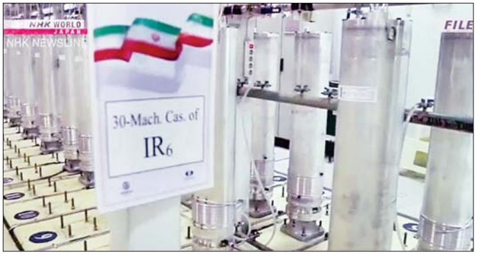
သော ၂၀၁၈ ခုနှစ် မေလနောက်ပိုင်း အီရန်နိုင်ငံသည် က သတ်မှတ်ထားသော ကန့်သတ်ချက်ထက် သန့်စင်မှု ၆၀ ရာခိုင်နှုန်းအထိရှိသော ယူရေနီယံများ များစွာကျော်လွန်နေကြောင်း သိရသည်။ ကို ထုတ်လုပ်လျက်ရှိကြောင်း သိရသည်။ ယင်း အင်အိတ်ချ်ကေ

ကိရိယာများ တပ်ဆင်ခြင်းကို စတင်ခဲ့ကြောင်း အိုင်အေအီးအေက ပြောသည်။ အီရန်နိုင်ငံ၏ လုပ်ဆောင်မှုများက JCPOA ၏ ကန့်သတ်ချက်များကို သိသိသာသာကျော်လွန်နေပြီးဖြစ်သော သန့်စင်ယူ ရေနံယံသိုလှောင်မှုဗမာဏနှင့် သန့်စင်မှုစွမ်းရည် များကို ထပ်မံတိုးလာစေမည်ဖြစ်ကြောင်း အဆိုပါ သုံးနိုင်ငံက စနေနေ့တွင် ထုတ်ပြန်ကြေညာ ခဲ့သည်။ JCPOA သည် ၂၀၁၅ ခုနှစ်က အီရန်နိုင်ငံနှင့် ချုပ်ဆိုထားသော ပူးတွဲဘက်စုံလုပ်ဆောင်မှုအစီ အစဉ်ဖြစ်သည်။ ၂၀၁၅ ခုနှစ် သဘောတူညီချက်မှ အမေရိကန်နိုင်ငံက တစ်ဖက်သတ်ရုပ်သိမ်းလိုက်