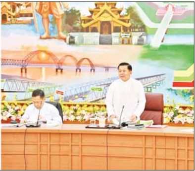
နိုင်ငံတော်စီမံအုပ်ချုပ်ရေးကောင်စီဥက္ကဋ္ဌ နိုင်ငံတော်ဝန်ကြီးချုပ် ဗိုလ်ချုပ်မှူးကြီး မင်းအောင်လှိုင် မှတ်ပုံတင်ခွင့်ပြုပြီး နိုင်ငံရေးပါတီများမှ တာဝန်ရှိသူများနှင့် ဖေဖော်ဝါရီ ၁၃ ရက်က တွေ့ဆုံ၍ ပြည်တွင်းငြိမ်းချမ်းရေးဆိုင်ရာများ ဆွေးနွေးပြောကြားစဉ်။

ကယားပြည်နယ်သည် ပြည်ထောင်စုသားများကြားတွင် ထင်ရှားသည်။ တောင်ကွဲစေတီတော်ရင်ပြင် မှမြို့ကို ရှုကြည့်လျှင် လယ်ကွင်းများ၊ တောင်တန်းများနှင့် စိမ်းလန်းစိုပြည်သော မြို့ရွာခင်းများကို တွေ့မြင်ရပေမည်။ တောင်ကွဲစေတီနှင့် ခရစ်ယာန်ဘုရားရှိခိုးကျောင်းများကား မြို့ခံတိုင်းရင်းသားတို့၏ ဘာသာတရားကိုးကွယ်မှုနှင့် နူးညံ့သောစိတ်နေစိတ်ထားတို့ကို ဆဲဝါးမှန်းဆ တွေ့မြင်နိုင်မည်ဖြစ်သည်။