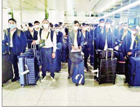
ဂျပန်ကုမ္ပဏီများ၏အိတ်ယူမှုဖြင့် မြန်မာအလုပ်သမားအချို့ ထွက်ခွာသွားမှုကို ၂၀၂၃ ခုနှစ်က တွေ့ရစဉ်။

“1111” မှတစ်ဆင့် SMS ဖြင့် ပေးပို့မေးမြန်းသော မေးခွန်းများကို ပြည်သူများက အကြံပြုပြောကြားပေးခြင်းဖြင့် အစိုးရဌာန/ အဖွဲ့အစည်းများ၏ ဝန်ဆောင်မှုလုပ်ငန်းများ၌ လိုအပ်ချက်နှင့် အားနည်းချက်များကို သိရှိပြုပြင်နိုင်မည်ဖြစ်ပါသည်။ ၃။ သို့ဖြစ်ပါ၍ ပြည်သူများအနေဖြင့် အကတိလိုက်စားမှု တိုက်ဖျက်ရေးလုပ်ငန်းစဉ်များတွင် ပူးပေါင်းပါဝင်ဆောင်ရွက်ပေးနိုင်ပါရန်နှင့် ပြည်သူများက သက်သာသောနည်းစံဖြင့် SMS များ ပြန်လည်ဖြေကြားပေးနိုင်ရေး ဆက်သွယ်ရေးအော်ပရေတာများနှင့် ညှိနှိုင်းဆောင်ရွက်ထားပါကြောင်း အသိပေးတိုက်တွန်းနှိုးဆော်အပ်ပါသည်။ အကတိလိုက်စားမှုတိုက်ဖျက်ရေးကော်မရှင်