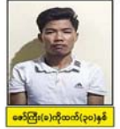
အောင်ကြီး(ခ)ကိုထက်(၂၀)နှစ်