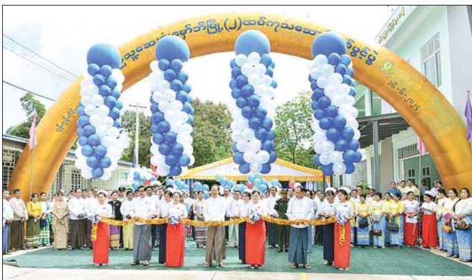
၂၀၂၃ ခုနှစ် ဩဂုတ် ၁၈ ရက်တွင် စတင်ဆောက်လုပ်ခဲ့ရာ ၂၀၂၄ ခုနှစ် မတ် ၃၀ ရက်တွင် လုပ်ငန်းများ ပြီးစီးခဲ့ကြောင်း၊ အဆိုပါ အဆောက်အအုံ ဖြေညီထပ်တွင် အရေးပေါ် လူနာစမ်းသပ်ခန်း၊ ကိုယ်ဝန်ဆောင်မိခင်စောင့်ကြပ်ကြည့်ရှုခန်း၊ သားဖွားခန်း၊ နှစ်ခန်း၊ မွေးပြီးလူနာ စောင့်ကြပ်ကြည့်ရှုခန်း၊ မွေးကင်းစကလေးလူနာ စောင့်ကြပ်ကြည့်ရှုခန်း၊ စတီခန်း၊ ဆေးဝေးခန်းတို့ပါဝင်ပြီး ပထမထပ်တွင် အမျိုးသမီးလူနာဆောင်များ၊ ကြပ်မတ်ကုသခန်း၊ ကလေးလူနာကုသခန်းတို့ ပါဝင်ပါကြောင်း ပြောကြားသည်။ ယင်းနောက် ရန်ကုန်တိုင်းဒေသကြီး ဝန်ကြီးချုပ်က နှစ်ထပ်ဆေးကုသဆောင်သစ်တွင် လူနာများ အသုံးပြုရန်အတွက်

နေပြည်တော် ဇွန် ၁၆ မှော်ဘီမြို့ပြည်သူ့ဆေးရုံ၏ နှစ်ထပ် ကုသဆောင်သစ်ဖွင့်ပွဲ အခမ်းအနားကို ယနေ့ နံနက်ပိုင်းတွင် ကျင်းပရာ ကျန်းမာရေးဝန်ကြီးဌာန ပြည်ထောင်စုဝန်ကြီး ဒေါက်တာသက်ခိုင်ဝင်း၊ ရန်ကုန်တိုင်းဒေသကြီး ဝန်ကြီးချုပ် ဦးစိုးသိန်း၊ တိုင်းဒေသကြီးအစိုးရအဖွဲ့ အဖွဲ့ဝင်ဝန်ကြီးများ၊ ဌာနဆိုင်ရာ အကြီးအကဲများ၊ ဖိတ်ကြားထားသော ဧည့်သည်တော်များနှင့် တာဝန်ရှိသူများ တက်ရောက်ကြသည်။ ဦးစွာ ပြည်ထောင်စုဝန်ကြီး တိုင်းဒေသကြီး ဝန်ကြီးချုပ်နှင့် ကုသရေးဦးစီးဌာန ညွှန်ကြားရေးမှူးချုပ် ဒေါက်တာမြတ်ဝဏ္ဏစိုး တို့က နှစ်ထပ်ကုသဆောင်သစ်ကို ဖဲကြီးမြတ်၍ ဖွင့်လှစ်ပေးကြပြီး(အပေါ်ယာပုံ)တက်ရောက်လာကြသူများက ဖွင့်ပွဲအထိမ်းအမှတ်ကမ္ပည်းမော်ကွန်းကို အမွှေးနံ့သာရည်ဖြင့် ပတ်ဖျန်းပေးကြသည်။ ထို့နောက် ပြည်ထောင်စုဝန်ကြီးက အဖွင့်အမှာစကား ပြောကြားရာတွင် ယနေ့ ဖွင့်လှစ်သည့် ပြည်သူ့ဆေးရုံ မှော်ဘီမြို့၏ နှစ်ထပ် ကုသဆောင်သစ်သည် ၁၆၈၀၀ စတုဂံပေ အကျယ် အဝန်းရှိကာ နိုင်ငံတော်မှ ခွင့်ပြုရန်ပုံငွေကျပ် ၁၁၅၉ ဒသမ ၂၀၀ သန်း ကုန်ကျခဲ့ပြီး ဆောက်လုပ်ရေးဝန်ကြီးဌာန အဆောက်အအုံအထူးအဖွဲ့ (၂)ကို လုပ်ငန်းအပ်နှံ၍