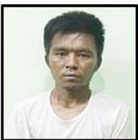
ဇာနည်အောင်(ခ)ကိုဇာ(၂၃)နှစ်