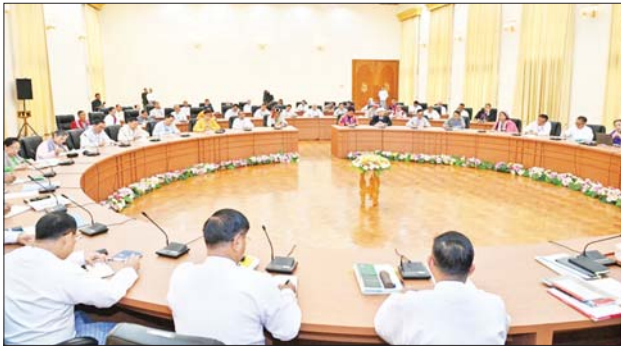
နိုင်ငံတော်စီမံအုပ်ချုပ်ရေးကောင်စီဥက္ကဋ္ဌ နိုင်ငံတော်ဝန်ကြီးချုပ် ဗိုလ်ချုပ်မှူးကြီး မင်းအောင်လှိုင် မှတ်ပုံတင်ခွင့်ပြုပြီး နိုင်ငံရေးပါတီများမှ တာဝန်ရှိသူများနှင့် ဖေဖော်ဝါရီ ၁၃ ရက်က တွေ့ဆုံ၍ ပြည်တွင်းငြိမ်းချမ်းရေးဆိုင်ရာများ ဆွေးနွေးပြောကြားစဉ်။

ကယားပြည်နယ် လွိုင်ကော်မြို့လေးမှာ အေးချမ်းငြိမ်သက်လှသည်။ မြို့နေလူထုကလည်း အတော်အသင့်မျှသာဖြစ်၍ လူနေကျပါးသည်။ သို့သော် တစ်နိုင်ငံလုံးကို လျှပ်စစ်ဓာတ်အား ဖြန့်ဝေပေးရာ လောပိတဓာတ်အားပေးစက်ရှိကြောင့်