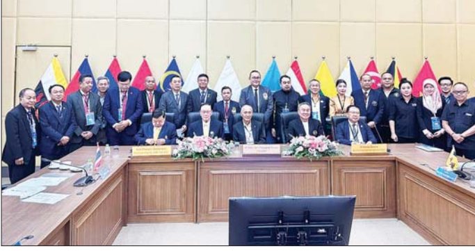
၁၁ နာရီခွဲတွင် လေကြောင်းခရီးဖြင့် ရန်ကုန်မြို့သို့ ပြန်လည်ရောက်ရှိကြသည်။

ရန်ကုန် ဇွန် ၁၆ မြန်မာနိုင်ငံ အိုလံပစ်ကော်မတီ ဥက္ကဋ္ဌ အားကစားနှင့်လူငယ်ရေးရာ ဝန်ကြီးဌာန ပြည်ထောင်စုဝန်ကြီး ဦးမင်းသိန်းဇံ ဦးဆောင်သော မြန်မာကိုယ်စားလှယ်အဖွဲ့သည် ဇွန် ၁၄ ရက်မှ ၁၅ ရက်အထိ ထိုင်းနိုင်ငံ ဘန်ကောက်မြို့၌ ကျင်းပသည့် (၃၃) ကြိမ်မြောက် အရှေ့တောင်အာရှ အားကစား ပြိုင်ပွဲကျင်းပနိုင်ရေး အရှေ့တောင် အာရှ အားကစားအဖွဲ့ချုပ်များ ပထမအကြိမ် အစည်းအဝေး (1 st Southeast Asian Games Federation (SEAGF) Meetings) သို့ တက်ရောက်ပြီး ယနေ့နံနက်