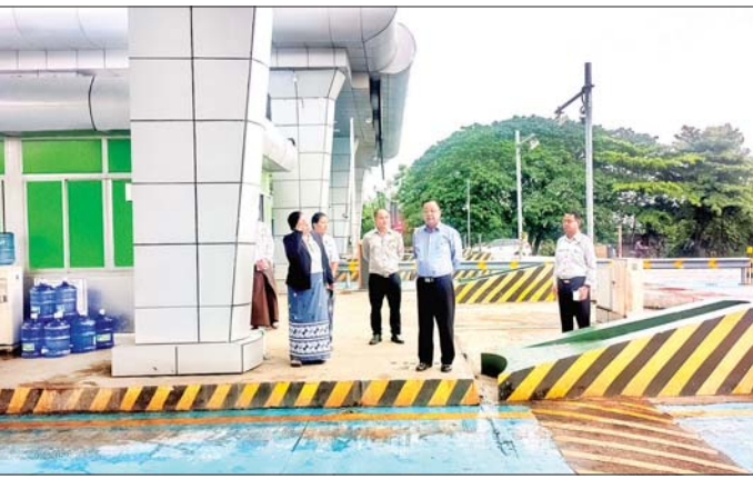
သတိမှတ်ထားသည့် ပုံစံအတိုင်း လိုက်နာဆောင်ရွက်ရေး တာဝန်ရှိ သူများက အလေးထားကြပ်မတ် ဆောင်ရွက်သွားရန် မှာကြား သည်။

သန့်ရှင်းရေးဆောင်ရွက်ထားရှိမှု တို့ကို ကြည့်ရှုစစ်ဆေးသည်။ ထိုသို့စစ်ဆေးစဉ် ဒုတိယ ဝန်ကြီးက တိုးတက်မှုများ၌ လမ်းအသုံးပြုခ ကောက်ခံရာတွင် ယာဉ်စာရင်း အရေအတွက်နှင့် ကောက်ခံရရှိငွေ မှန်ကန်စွာ စာရင်းရေးသွင်းရေး၊ တိုးတက် များအားလုံး CCTV တပ်ဆင်ထား ပြီး ကွန်ပျူတာစနစ်ဖြင့် ကောက်ခံစေရေး၊ ကောက်ခံရရှိငွေ များ လေလွှင့်ဆုံးရှုံးမှုမရှိစေရေး၊ တိုးတက်ပတ်ဝန်းကျင်သန့်ရှင်း၊ သပ်ရပ်ပြီး ဥပမာရုပ်ကောင်မွန်စေ ရေး၊ ကောက်ခံရရှိမှု စာရင်းဇယား များ ရေးသွင်းရာတွင် ရုံးချုပ်မှ