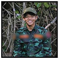
ချိုကြီး(ခ)ဟိန်းထက်အောင်(၂၁)နှစ်