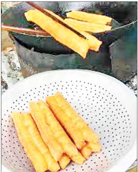
နှမ်းနှင့်မြေပဲဆီမှာ စားအုန်းဆီထက် ဈေးသုံးဆဲဆဲ ပိုမိုများပြားလျက်ရှိပါသည်။ ထို့ကြောင့် ဈေးကွက်အနေအထားအရ စားအုန်းဆီမှာ အခြားဆီများထက် ဈေးကွက်နေရာ ပိုမိုရရှိနေသည်ပင်ဖြစ်ပါသည်။

မြန်မာနိုင်ငံတွင် ဆီလိုအပ်မှုမှာ ပြည်တွင်းစားသုံးမှု စက်မှုလုပ်ငန်းသုံးနှင့် ဟိုတယ်ခရီးသွားလုပ်ငန်းသုံး အားလုံးပေါင်းအတွက် နှစ်စဉ် ဆီတန်ချိန် ၁၁ သိန်းခန့်လိုအပ်လျက်ရှိရာ ပြည်တွင်းဆီ ထုတ်လုပ်မှုသာမက ပြည်ပမှဆီအမျိုးမျိုးကို နှစ်စဉ်ဆီတန်ချိန် ၉ သိန်းခန့်လိုအပ်နေကြောင်း သိရှိရပါသည်။ ပြည်တွင်းလိုအပ်ချက်ပြည့်မီရန်အတွက် ပြည်ပမှ စားသုံးဆီအမျိုးမျိုးကို တင်သွင်းနေလျက်ရှိရာ ၉၀ ရာခိုင်နှုန်းကျော်မှာ စားအုန်းဆီဖြစ်ပါသည်။ ပြည်တွင်းဈေးကွက်ရှိ ကာလပေါက်ဈေးအရ နေကြာဆီသည် စားအုန်းဆီထက် ဈေးနှုန်းဆန့်ကျင်