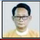
ရန်ကုန်မြို့အတွင်း အကြမ်းဖက်ဖောက်ခွဲမှုများ လုပ်ဆောင်ရန် စေခိုင်းသူ