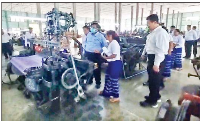
စက်အရန်ပစ္စည်းများကို ကြိုတင်ဝယ်ယူထားရန်၊ စက်ရုံအနေဖြင့် ပြည်ပသွင်းကုန်အစားထိုးလုပ်ငန်းများ ဆောင်ရွက်နေခြင်းဖြစ်၍ လုပ်ငန်းတာဝန်များကို ကြိုးစားဆောင်ရွက်ကြရန် မှာကြားပြီး စက်ရုံအတွင်း အထည်များ ရက်လုပ်နေသည့် လုပ်ငန်းစဉ်အဆင့်ဆင့်တို့ကို အဆင့်ဆင့်တို့ကို လှည့်လည်ကြည့်ရှုစစ်ဆေးသည်။ ထို့နောက် ပြည်ထောင်စုဝန်ကြီးသည် ဝမ်းတွင်းမြို့ရှိ မြသဇင်ချည်ချောလှေချည်လုပ်ငန်း၏ ဆိုလာစနစ်အသုံးပြု၍ ထုတ်လုပ်မှုလုပ်ငန်း ဆောင်ရွက်နေမှု၊ နန်းထိုက်တော်ဝင် အထည်စက်ရုံနှင့် မင်းရန်နိုင်ဝါကြိတ်စက်တို့တွင် အထည်များရက်လုပ်နေမှု ဝါများကြိုတင်ဆွဲဆောင်မှု လုပ်ငန်းစဉ်အဆင့်ဆင့်တို့ကို လှည့်လည်အားပေးကြည့်ရှုစစ်ဆေး၍ လုပ်ငန်းရုံများ၏ တင်ပြချက်များကို ပေါင်းစပ်ညှိနှိုင်းဆောင်ရွက်ပေးခဲ့ကြောင်း သတင်းရရှိသည်။ သတင်းစဉ်

လုပ်ငန်းများ၊ MSME များ ဖွံ့ဖြိုးတိုးတက်ရေးအတွက် ယခုထက် ပိုမိုကြိုးစားဆောင်ရွက်ကြရမည်ဖြစ်ကြောင်း မှာကြားသည်။ ဆက်လက်၍ ပြည်ထောင်စုဝန်ကြီးသည် မိတ္ထီလာစက်မှုဇုန်သို့ သွားရောက်၍ ဦးစော်ဦးဝါကြိတ်စက်နှင့် ဝါစေ့ဆီလုပ်ငန်း၊ ဟိန်းထက်စော်စက်ရက်ကန်းနှင့် အထည်ချုပ်လုပ်ငန်းများကို ကြည့်ရှုစစ်ဆေးပြီး လုပ်ငန်းရုံငှားနှင့် တွေ့ဆုံ၍ ဝါအခြေခံ စက်မှုလုပ်ငန်းများ ဖွံ့ဖြိုးတိုးတက်ရေးအတွက် ပံ့ပိုးဆောင်ရွက်ပေးရမည့် အချက်များကို အကြံပြုဆွေးနွေးမှာကြားသည်။ မွန်းလွဲပိုင်းတွင် ပြည်ထောင်စုဝန်ကြီးသည် အမှတ် (၇)အထည်စက်ရုံခွဲ(ဝမ်းတွင်း)သို့ ရောက်ရှိ စစ်ဆေးပြီး (ယာပုံ) အထည်များရက်လုပ်ရာတွင် သုံးစွဲသူများ စိတ်ဝင်စားပြီး ဆွဲဆောင်မှုရှိမည့် အဆင်အခြေများဖြစ်အောင် ဆောင်ရွက်ရန်၊ ဈေးကွက်ရရှိမှုပေး ရေရှည်ရပ်တည် လည်ပတ်နိုင်မည်ဖြစ်၍ ဈေးကွက်သုတေသနလုပ်ငန်းများကို စဉ်ဆက်မပြတ်ဆောင်ရွက်ရန်၊ တတ်ဆင်ရေးကဏ္ဍ ဖူလှစေရေးအတွက် ထုတ်လုပ်မှုလုပ်ငန်းများကို တိုးမြှင့်ဆောင်ရွက်နိုင်ရေး စီမံဆောင်ရွက်ရန်၊ ကုန်ထုတ်လုပ်မှုလုပ်ငန်းများ စဉ်ဆက်မပြတ်လည်ပတ်ဆောင်ရွက်နိုင်ရေးအတွက် လိုအပ်သော