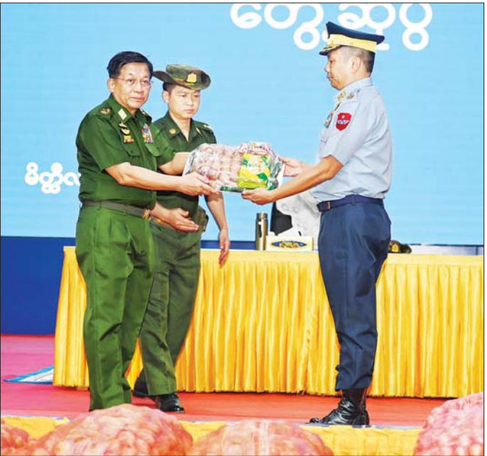
နိုင်ငံတော်စီမံအုပ်ချုပ်ရေးကောင်စီဥက္ကဋ္ဌ တပ်မတော်ကာကွယ်ရေးဦးစီးချုပ် ဗိုလ်ချုပ်မှူးကြီး မင်းအောင်လှိုင် မိတ္ထီလာတပ်နယ်မှ အရာရှိ၊ စစ်သည်၊ မိသားစုများအတွက် စားသောက်ဖွယ်ရာပစ္စည်းများ ပေးအပ်စဉ်။

စာမျက်နှာ ၃ မှ မိမိတို့တစ်ဦးချင်း စွမ်းဆောင်ရည်များနှင့် မိမိတို့၏ မိသားစု၊ အဖွဲ့အစည်းအပေါ်တွင် ထိခိုက်မှု မရှိအောင် ထိန်းထိန်းသိမ်းသိမ်း နေထိုင်ကြရမည်ဖြစ်ကြောင်း၊ တစ်ဦးချင်းကိုယ်စီ အသိတရား၊ ဆင်ခြင်တုံတရား များဖြင့် ထိန်းသိမ်းနေထိုင်ခြင်းဖြင့် မိမိကိုယ်မိမိ တည်ဆောက်ကြရမည်ဖြစ်ကြောင်း။ သက်သာချောင်ချိရေးနှင့် ညီညွတ်မျှတသည့် အုပ်ချုပ်မှုပုံစံဖြစ်စေရေး သက်သာချောင်ချိရေးနှင့်ပတ်သက်၍ တပ်ပိုင် နှင့် တစ်နိုင်တစ်ပိုင် စိုက်ပျိုးမွေးမြူရေးလုပ်ငန်းများ ကို အောင်မြင်အောင် ဆောင်ရွက်ကြစေလိုကြောင်း၊ မိသားစုဝင်များ၏ စီးပွားရေးအဖွဲ့အစည်းများကို အထောက်အကူဖြစ်စေနိုင်သည့် သီးနှံများကို စိုက်ပျိုးခြင်းဖြင့်