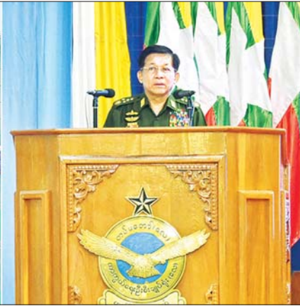
နိုင်ငံတော်စီမံအုပ်ချုပ်ရေးကောင်စီဥက္ကဋ္ဌ တပ်မတော်ကာကွယ်ရေးဦးစီးချုပ် ဗိုလ်ချုပ်မှူးကြီး မင်းအောင်လှိုင် အလယ်ပိုင်းတိုင်းစစ်ဌာနချုပ်၊ မိတ္ထီလာတပ်နယ်မှ အရာရှိ၊ စစ်သည်၊ မိသားစုဝင်များအား တွေ့ဆုံအမှာစကားပြောကြားစဉ်။