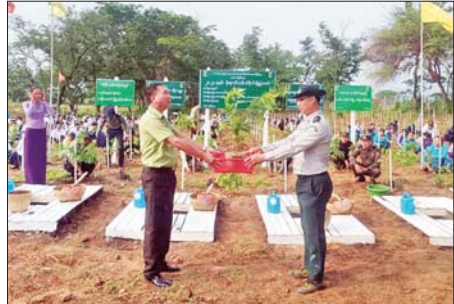
ဆင်ပေါင်ဝဲမြို့၌ မိုးရာသီစုပေါင်းသစ်ပင်စိုက်ပျိုး

မှထည့်ဝင် လျှော့ဒါန့်ငွေကျပ်သိန်း ၁၀၀ တို့ကို မတည့်၍ ကျောင်း အကျိုးတော်ဆောင်အဖွဲ့၊ ကျောင်း သားမိဘများနှင့် စေတနာရှင် အလှူရှင်များ ထည့်ဝင်လှူဒါန့်ငွေ များဖြင့် တည်ဆောက်သွား မည်ဖြစ်ပြီး (၄၀ x၂၄ x၂၀) ပေ အာရုံစီအဆောက်အအုံ အမျိုး အစားဖြစ်သည်။ ပန္နက်တော်တင် မင်္ဂလာ အခမ်းအနားသို့ ကရင်ပြည်နယ် ဝန်ကြီးချုပ် ဦးစောမြင့်ဦး၊ ပြည် နယ်တရားလွှတ်တော် တရား သူကြီးချုပ် ဒေါ်ခင်စောထွန်း၊ ပြည် နယ်အစိုးရအဖွဲ့ဝင်များ၊ ကရင်ပြည် နယ်စာကြည့်တိုက်များဖောင်ဒေးရှင်း ဥက္ကဋ္ဌတို့ တက်ရောက်၍ မင်္ဂလာပန္နက်တော်များကို ရိုက် သွင်းပြီး အမွှေးနံ့သာရည်များ ပက်ဖျန်းပေးသည်။ (ဝဲပုံ) ထို့နောက် ပြည်နယ်ဝန်ကြီး ချုပ်နှင့်အဖွဲ့သည် မြန်နွာမိုးလုံ လေလုံအားကစား ခန်းမအား လှည့်လည်ကြည့်ရှုစစ်ဆေးသည်။ စောမျိုးမင်းသိန်း(ပြန်/ဆက်)