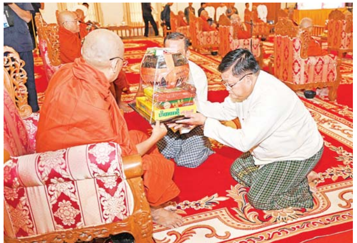
နိုင်ငံတော်စီမံအုပ်ချုပ်ရေးကောင်စီအဖွဲ့ဝင် ဦးရန်ကျော် ဆရာတော်ထံ ဝါဆိုသင်္ကန်းနှင့် လှူဖွယ်ပစ္စည်းများ ဆက်ကပ်လှူဒါန်းစဉ်။