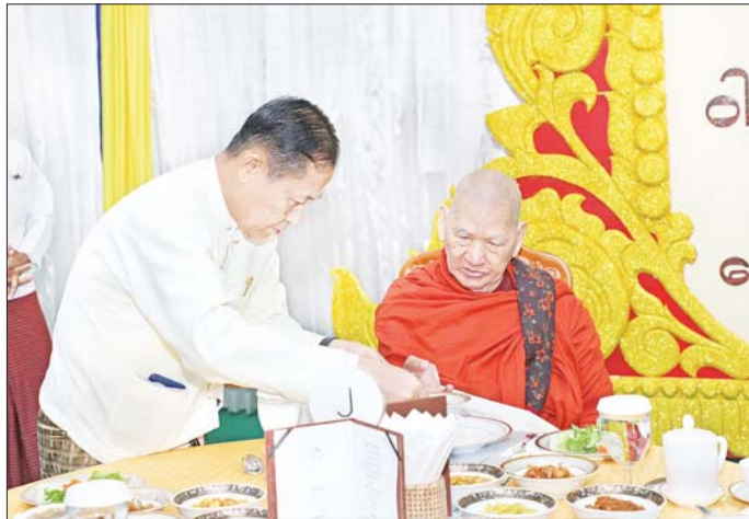
နိုင်ငံတော်စီမံအုပ်ချုပ်ရေးကောင်စီ ဒုတိယဥက္ကဋ္ဌ ဒုတိယဝန်ကြီးချုပ် ဒုတိယဗိုလ်ချုပ်မှူးကြီး စိုးဝင်း ဆရာတော်အား နေ့ဆွမ်းဆက်ကပ်လှူဒါန်းစဉ်။