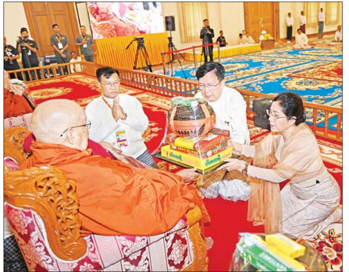
နိုင်ငံတော်စီမံအုပ်ချုပ်ရေးကောင်စီ အတွင်းရေးမှူး ဒုတိယဗိုလ်ချုပ်ကြီး အောင်လင်းဒွေးနှင့်ဇနီးတို့ ပေါက်မြိုင်ကျောင်းဆရာတော်ထံ ဝါဆိုသင်္ကန်းနှင့် လှူဖွယ်ပစ္စည်းများ ဆက်ကပ်လှူဒါန်းစဉ်။