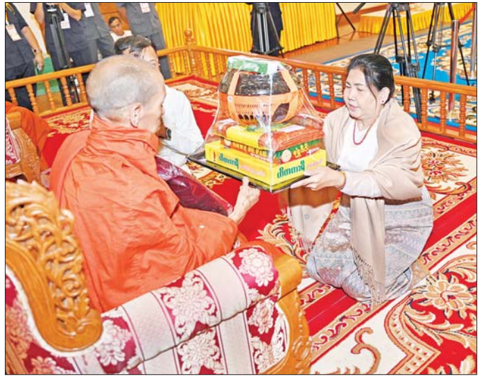
နိုင်ငံတော်စီမံအုပ်ချုပ်ရေးကောင်စီအဖွဲ့ဝင် ဗိုလ်ချုပ်ကြီး မောင်မောင်အေး၏ဇနီး ပါဠိတက္ကသိုလ် မင်္ဂလာဇေယျစာသင်တိုက်ဆရာတော်ထံ ဝါဆိုသင်္ကန်းနှင့် လှူဖွယ်ပစ္စည်းများ ဆက်ကပ်လှူဒါန်းစဉ်။