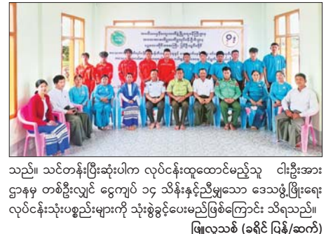
သည့်။ သင်တန်းပြီးဆုံးပါက လုပ်ငန်းထူထောင်မည့်သူ ငါးဦးအား ဌာနမှ တစ်ဦးလျှင် ငွေကျပ် ၁၄ သိန်းနှင့်ညီမျှသော ဒေသဖွံ့ဖြိုးရေး လုပ်ငန်းသုံးစရိတ်များကို သုံးစွဲခွင့်ပေးမည်ဖြစ်ကြောင်း သိရသည်။ (ဇူလိုင် ၁၆) ပြန်/ဆက်