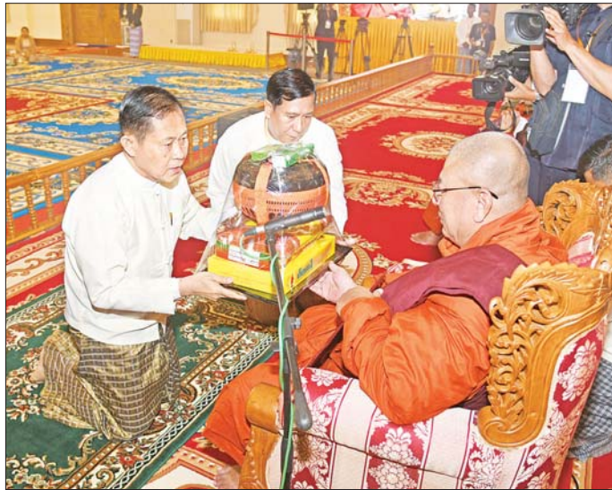
နိုင်ငံတော်စီမံအုပ်ချုပ်ရေးကောင်စီ ဒုတိယဥက္ကဋ္ဌ ဒုတိယဝန်ကြီးချုပ် ဒုတိယဗိုလ်ချုပ်မှူးကြီး စိုးဝင်း နိုင်ငံတော်သံဃမဟာနာယကအဖွဲ့ အကျိုးတော်ဆောင်၊ မစိုးရိမ်တိုက်သစ်ဆရာတော်ကြီးထံ ဝါဆိုသင်္ကန်းနှင့် လှူဖွယ်ပစ္စည်းများ ဆက်ကပ်လှူဒါန်းစဉ်။