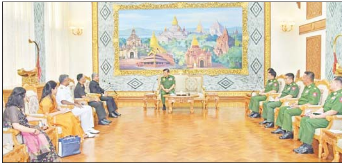
များ ဖြစ်သည်နှင့်အညီ နှစ်နိုင်ငံ တိုးတက်ကောင်းမွန်လျက်ရှိသည့် အခြေအနေများ၊ နှစ်နိုင်ငံ နယ်စပ် အေးချမ်းရေး၊ တရားဥပဒေစိုးမိုးရေးများတွင် နှစ်နိုင်ငံ ပူးပေါင်း ဆောင်ရွက်မှု တိုးမြှင့်ဆောင်ရွက်

နေပြည်တော် ဇူလိုင် ၁၆ နိုင်ငံတော်စီမံအုပ်ချုပ်ရေးကောင်စီ အဖွဲ့ဝင် ညှိနှိုင်းကွပ်ကဲရေးမှူး (ကြည်း၊ ရေ၊ လေ) ဗိုလ်ချုပ်ကြီး မောင်မောင်အေးသည် မြန်မာ နိုင်ငံဆိုင်ရာ အိန္ဒိယနိုင်ငံသံအမတ် ကြီး H.E. Mr. Abhay Thakur ဦးဆောင်သော ကိုယ်စားလှယ် အဖွဲ့အား ယနေ့မွန်းလွဲပိုင်းတွင် နေပြည်တော်ရှိ ဘုရင့်နောင် ရိပ်သာဧည့်ခန်းမဆောင်၌ လက်ခံ တွေ့ဆုံသည်။