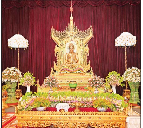
နိုင်ငံတော်စီမံအုပ်ချုပ်ရေးကောင်စီဥက္ကဋ္ဌ နိုင်ငံတော်ဝန်ကြီးချုပ် ဗိုလ်ချုပ်မှူးကြီး မင်းအောင်လှိုင် သာသနာ့မဟာမိတ်မာန်တော်ကြီးအတွင်းရှိ ဗုဒ္ဓရုပ်ပွားတော်မြတ်အား ဖူးမြော်ကြည်ညို၍ မြသပိတ်ဆွမ်းတော်၊ သစ်သီး၊ ပန်း၊ သောက်တော်ချေချမ်းနှင့် ဆီမီးတို့ကို ကပ်လှူပူဇော်စဉ်။