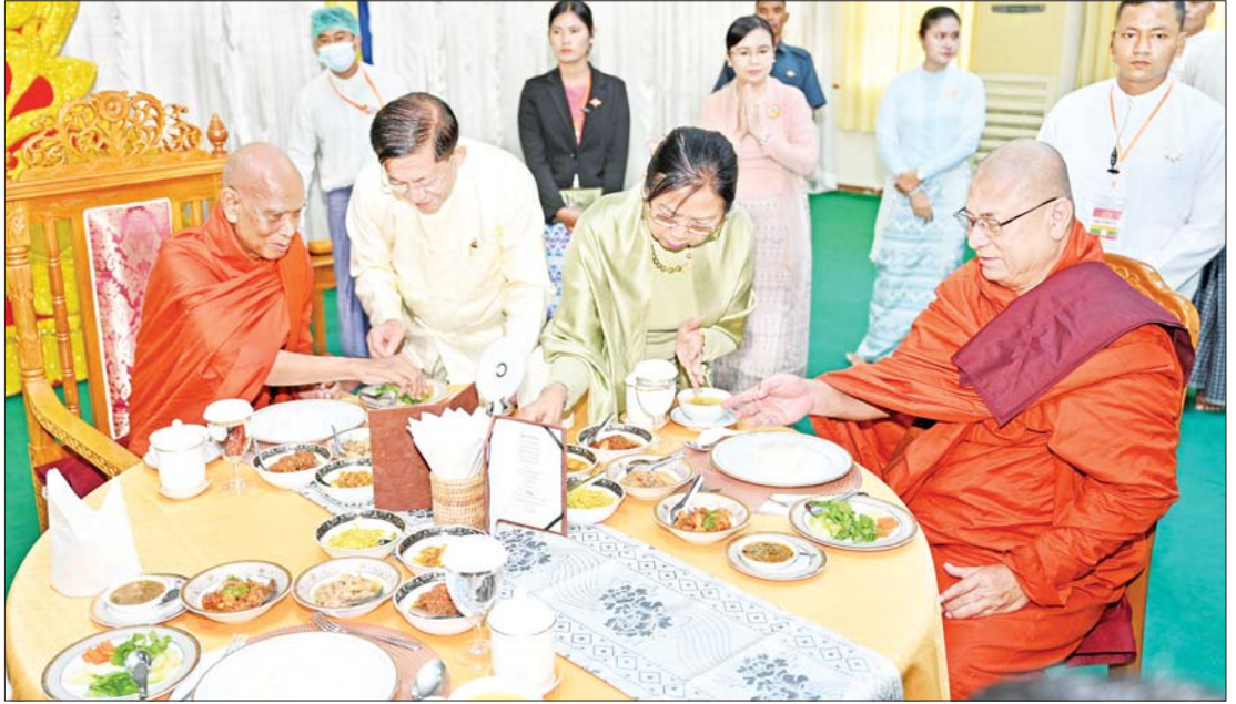
နိုင်ငံတော်စီမံအုပ်ချုပ်ရေးကောင်စီဥက္ကဋ္ဌ နိုင်ငံတော်ဝန်ကြီးချုပ် ဗိုလ်ချုပ်မှူးကြီး မင်းအောင်လှိုင်နှင့် ဇနီး ဒေါ်ကြူကြူလှတို့ ဆရာတော်၊ သံဃာတော်များအား နေ့ဆွမ်း ဆက်ကပ်လှူဒါန်းစဉ်။