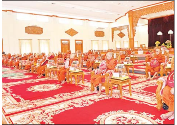
နိုင်ငံတော်စီမံအုပ်ချုပ်ရေးကောင်စီဥက္ကဋ္ဌ နိုင်ငံတော်ဝန်ကြီးချုပ် ဗိုလ်ချုပ်မှူးကြီး မင်းအောင်လှိုင်နှင့် ဇနီး ဒေါ်ကြာကြာလှ၊ အခမ်းအနားတက်ရောက်လာကြသူများ နိုင်ငံတော်သံဃမဟာနာယကအဖွဲ့ဥက္ကဋ္ဌ သန့်လှိုင်မြို့၊ မင်းကျောင်းပထမပြန်စာသင်တိုက် ပဓာနနာယက အဂ္ဂမဟာပဏ္ဍိတ အဂ္ဂမဟာသဒ္ဓမ္မဇောတိကဝေ ဒေါက်တာ ဘဒ္ဒန္တစန္ဒိမာဘိဝံသထံမှ ငါးပါးသီလခံယူဆောက်တည်ကြစဉ်။