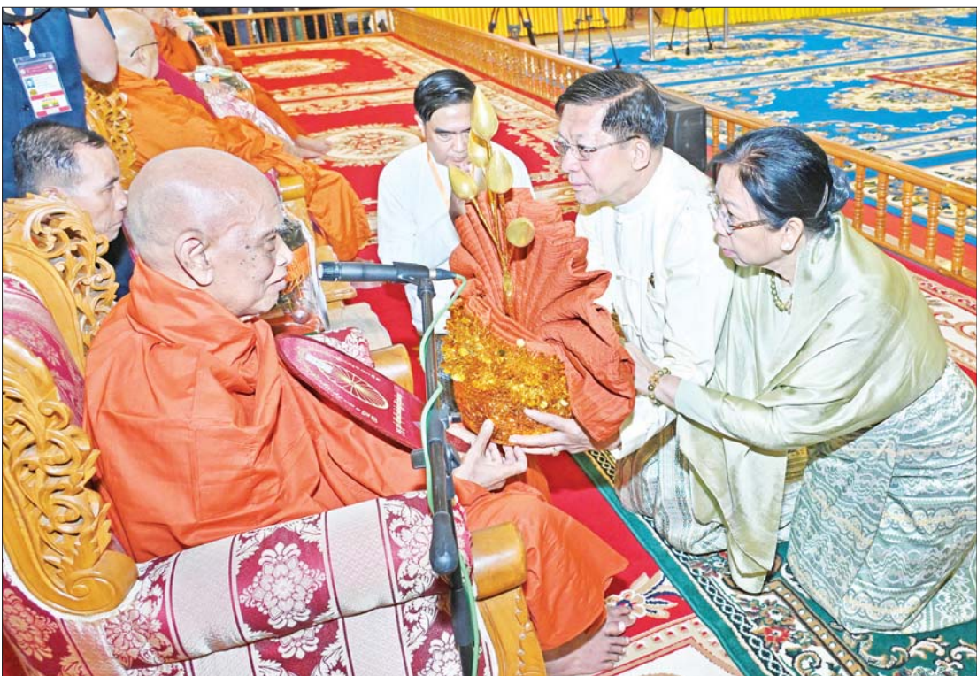
နိုင်ငံတော်စီမံအုပ်ချုပ်ရေးကောင်စီဥက္ကဋ္ဌ နိုင်ငံတော်ဝန်ကြီးချုပ် ဗိုလ်ချုပ်မှူးကြီး မင်းအောင်လှိုင်နှင့် ခေါ်ကြူကြူလှတို့ နိုင်ငံတော်သံဃမဟာနာယကအဖွဲ့ဥက္ကဋ္ဌ ရန်ကုန်တိုင်းဒေသကြီး သန်လျင်မြို့ မင်းကျောင်းပထမပြန်စာသင်တိုက် ပဓာနနာယက အဂ္ဂမဟာပဏ္ဍိတ အဂ္ဂမဟာသဒ္ဓမ္မဇောတိကဇ ခေါက်တာ ဘဒ္ဒန္တ စန္ဒိမာဘိဝံသ ထံ ဝါဆိုသင်္ဂဟ်ဆက် လှူဒါန်းပွဲများ ဆက်ကပ်လှူဒါန်းစဉ်။

နေပြည်တော် ဇူလိုင် ၁၆ ပြည်ထောင်စုသမ္မတမြန်မာနိုင်ငံတော်၊ နိုင်ငံတော်စီမံအုပ်ချုပ်ရေး ကောင်စီ၏ ၂၀၂၄ ခုနှစ်၊ ဝါဆိုသင်္ဂဟ်ဆက်ကပ် လှူဒါန်းပွဲ မဟာမင်္ဂလာအခမ်းအနားကို ယနေ့နံနက်ပိုင်းတွင်နေပြည်တော်ကောင်စီ နယ်မြေ ဥပဒေဦးစီးဌာနတော်မြတ်ကြီး ပရိဝုဏ်တော်အတွင်းရှိ သာသနာ့မဟာ ဝိမာန်တော်ကြီး၌ ကျင်းပပြုလုပ်ရာ နိုင်ငံတော်စီမံ အုပ်ချုပ်ရေးကောင်စီဥက္ကဋ္ဌ နိုင်ငံတော်ဝန်ကြီးချုပ် ဗိုလ်ချုပ်မှူးကြီး မင်းအောင်လှိုင်နှင့် ခေါ်ကြူကြူလှတို့ တက်ရောက်ကြည့်ရှုပြီး ဝါဆိုသင်္ဂဟ်ဆက် လှူဒါန်းပွဲများ ဆက်ကပ်လှူဒါန်း ကြသည်။