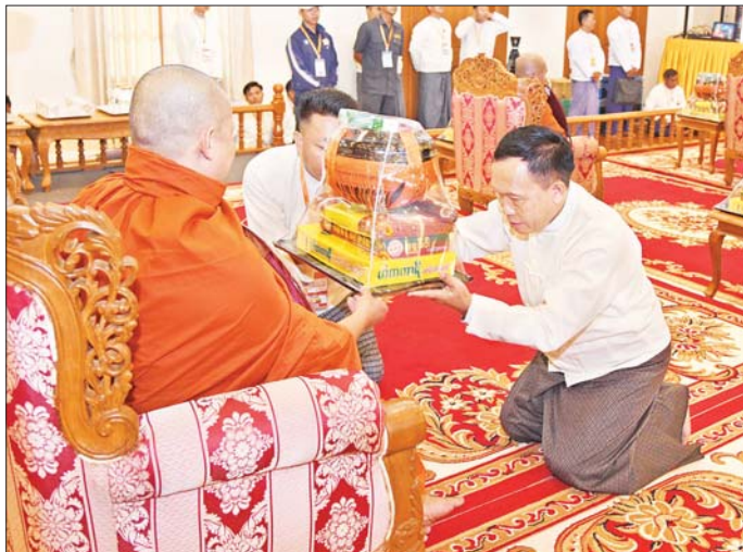
နိုင်ငံတော်စီမံအုပ်ချုပ်ရေးကောင်စီအဖွဲ့ဝင် ဦးရွှေကြိမ်း ဆရာတော်ထံ ဝါဆိုသင်္ကန်းနှင့် လှူဖွယ်ပစ္စည်းများ ဆက်ကပ်လှူဒါန်းစဉ်။