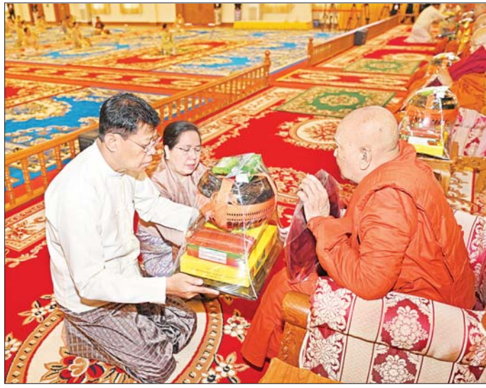
နိုင်ငံတော်စီမံအုပ်ချုပ်ရေးကောင်စီအဖွဲ့ဝင် ဗိုလ်ချုပ်ကြီး မြထွန်းဦးနှင့်ဇနီးတို့ အင်းသာအရှေ့ကျောင်းဆရာတော်ထံ ဝါဆိုသင်္ကန်းနှင့် လှူဖွယ်ပစ္စည်းများ ဆက်ကပ်လှူဒါန်းစဉ်။