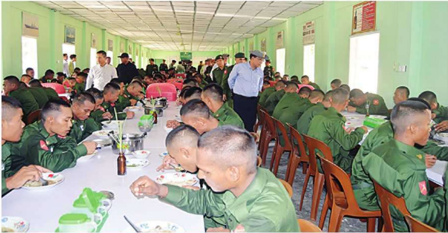
ပဲခူးတိုင်းဒေသကြီး၊ ဝန်ကြီးချုပ် ဦးမျိုးဆွေဝင်းနှင့် တာဝန်ရှိသူများက သင်တန်းသားစားရိပ်သာတွင် သင်တန်းသားများ နံနက်စာသုံးဆောင်နေမှုကို လိုက်လံကြည့်ရှုစစ်ဆေးစဉ်။

နေပြည်တော် မေ ၁၄ နိုင်ငံသားတိုင်းသည် ပြည်ထောင်စုမပြိုကွဲရေး၊ တိုင်းရင်းသားစည်းလုံးညီညွတ်မှု မပြိုကွဲရေးနှင့် အချုပ်အခြာအာဏာတည်တံ့ခိုင်မြဲရေး ဟူသည့် ဒို့တာဝန်အရေးသုံးပါးကို ထိန်းသိမ်းစောင့်ရှောက်ရန် တာဝန်ရှိကြသဖြင့် ယင်းတာဝန်များကို ထမ်းဆောင်ရန်အတွက် စစ်ပညာသင်ကြားရန်နှင့် နိုင်ငံတော်ကာကွယ်ရေးအတွက် စစ်မှုထမ်းဆောင်နိုင်ရန် ရည်ရွယ်၍ ပြည်သူ့စစ်မှုထမ်းဥပဒေကို ၂၀၁၀ ပြည့်နှစ် နိုဝင်ဘာလတွင် ဥပဒေအမှတ် (၂၇/၂၀၁၀)ဖြင့် ပြဋ္ဌာန်းခဲ့ပြီး ၂၀၂၄ ခုနှစ် ဖေဖော်ဝါရီ ၁၀ရက်တွင် စတင်အာဏာသက်ဝင်စေခဲ့ကာ ပြည်သူ့စစ်မှုထမ်းသင်တန်းအမှတ်စဉ် (၁)ကို တိုင်းဒေသကြီးနှင့် ပြည်နယ်အသီးသီး၌ အောင်မြင်စွာဖွင့်လှစ်သင်ကြားပေးလျက်ရှိသည်။ ဆက်လက်၍ ပြည်သူ့စစ်မှုထမ်းသင်တန်းအမှတ်စဉ်(၂)တွင် ပါဝင်တက်ရောက်ကြမည့် စာမျက်နှာ ၁၈ ကော်လံ ၁၂