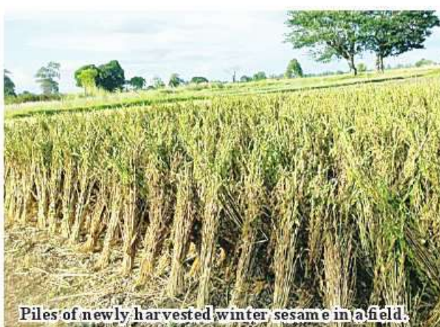
Piles of newly harvested winter sesame in a field.

Kyaukmyaung May 14 During the 2023-2024 winter crop planting season, the harvest of winter sesame in Kyaukmyaung Sub-township has been completed since February of this year. According to the Sub-township Agriculture Department, a total of 13,127 acres have been harvested, yielding an average of 14.15 baskets per acre. "We successfully planted 13,127 acres of winter sesame during the winter crop planting season in Kyaukmyaung Sub-township. All acres have now been harvested. Our efforts focused on expanding sesame cultivation, enhancing yields, and adopting Good Agricultural Practices (GAP) systems," stated Daw Khin Win, head of the Sub-township's Agriculture Department. In the 2023-2024 winter crop planting season, 13,125 acres of winter sesame were designated for planting in the sub-township. By October 2023 to December of the same year, 13,127 acres were successfully planted. Winter sesame farmers in Kyaukmyaung Sub-township received comprehensive education from the township Department of Agriculture on expanding