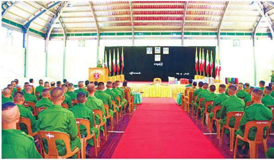
အရှေ့အလယ်ပိုင်းတိုင်းစစ်ဌာနချုပ် တိုင်းမှူး ဗိုလ်ချုပ်မျိုးမင်းထွန်း ပြည်သူ့စစ်မှုထမ်းသင်တန်း အမှတ်စဉ်(၂)မှ သင်တန်းသားများကို တွေ့ဆုံအမှာစကားပြောကြားစဉ်။