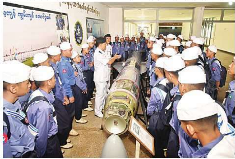
လေ့လာရေးခရီးစဉ်အဖြစ်လာရောက်သည့် ရေကြောင်းလူငယ် သင်တန်းသား၊ သင်တန်းသူများ ရေယာဉ်ဆိုင်ရာအချက်အလက်များအား လှည့်လည်ကြည့်ရှုလေ့လာကြရာ တာဝန်ရှိသူများက လိုက်လံရှင်းလင်းပြသစဉ်။

များ လွန်းတင်လွန်းချသည့်စနစ်များနှင့် ယင်းနောက် နေ့လယ်ပိုင်းတွင် စက်ရုံ၊ အလုပ်ရုံများရှိ တွင်ခုံ၊ ဖောက်ခုံ၊ သင်တန်းသား၊ သင်တန်းသူများသည် ရေဘော်ခုံများသို့ လှည့်လည်ကြည့်ရှု တပ်မတော်(ရေ)မှ စစ်ရေယာဉ်(မုတ္တမ) လေ့လာကြရာ တာဝန်ရှိသူများက ဖြင့် ရန်ကုန်မြစ်ကြောင်းတစ်လျှောက် လေ့လာရေးသွားရောက်ကြသည်။ လေ့လာ