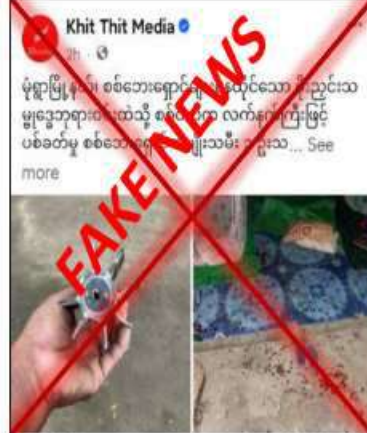
မိုးညှင်းသမ္မုဒ္ဓေဘုရားအနီးတွင် အကြမ်းဖက်လုပ်ငန်းများလုပ်ဆောင်ရန် PDF အမည်ခံ အကြမ်းဖက်သမားများရောက်ရှိနေကြောင်း သိရှိရသဖြင့် လုံခြုံရေးတပ်ဖွဲ့ဝင်များက လိုအပ်သော လုံခြုံရေးလုပ်ငန်းများဆောင်ရွက်ခဲ့ရာ အကြမ်းဖက်သမား

စစ်ကိုင်းတိုင်းဒေသကြီး မုံရွာမြို့နယ် မိုးညှင်းသမ္မုဒ္ဓေဘုရားဝင်းထဲသို့ မေ ၁၃ ရက်တွင် လုံခြုံရေးတပ်ဖွဲ့ဝင်များမှ လက်နက်ကြီးဖြင့်ပစ်ခတ်ခဲ့ကြောင်း၊ အဆိုပါ ပစ်ခတ်မှုကြောင့် ပြည်သူ တစ်ဦးသေဆုံးပြီး ခုနစ်ဦး ထိခိုက်ဒဏ်ရာများရရှိခဲ့သည်ဟု မဟုတ်မှန် စွပ်စွဲရေးသားထားသည် သတင်းတု၊ သတင်းမှားများကို တရားမဝင် ပြည်ဖျက်မီဒီယာများက အထင်အမြင် လွှဲမှားစေရန် လူမှုကွန်ရက်စာမျက်နှာများတွင် ဝါဒဖြန့်ဝေနေသည်ကို တွေ့ရှိရသည်။