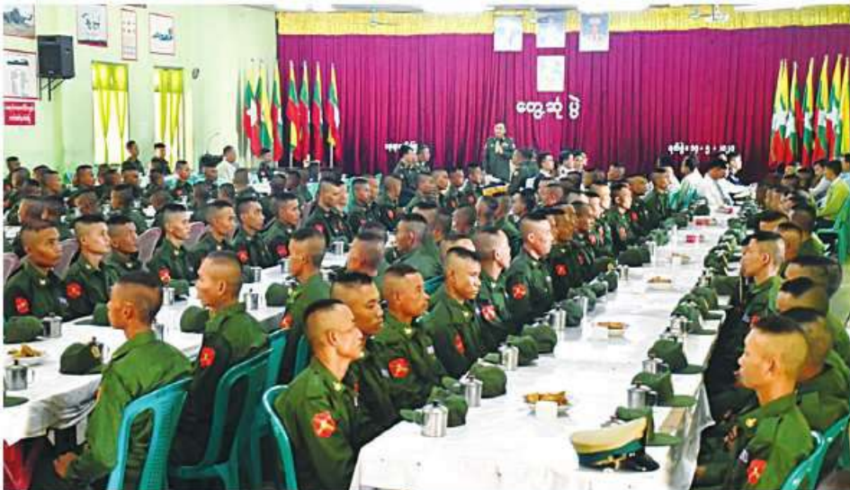
ရန်ကုန်တိုင်းစစ်ဌာနချုပ် တိုင်းမှူး ဝိုလ်ချုပ်ဇော်ဟိန်း ပြည်သူ့စစ်မှုထမ်းသင်တန်းအမှတ်စဉ်(၂)မှ သင်တန်းသားများကို တွေ့ဆုံအမှာစကားပြောကြားစဉ်။