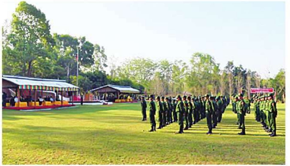
အမှောက်မြောက်တိုင်းစစ်ဌာနချုပ်၌ ပြည်သူ့စစ်မှုထမ်းသင်တန်းအမှတ်စဉ်(၂) သင်တန်းဖွင့်ပွဲအခမ်းအနား ကျင်းပစဉ်။