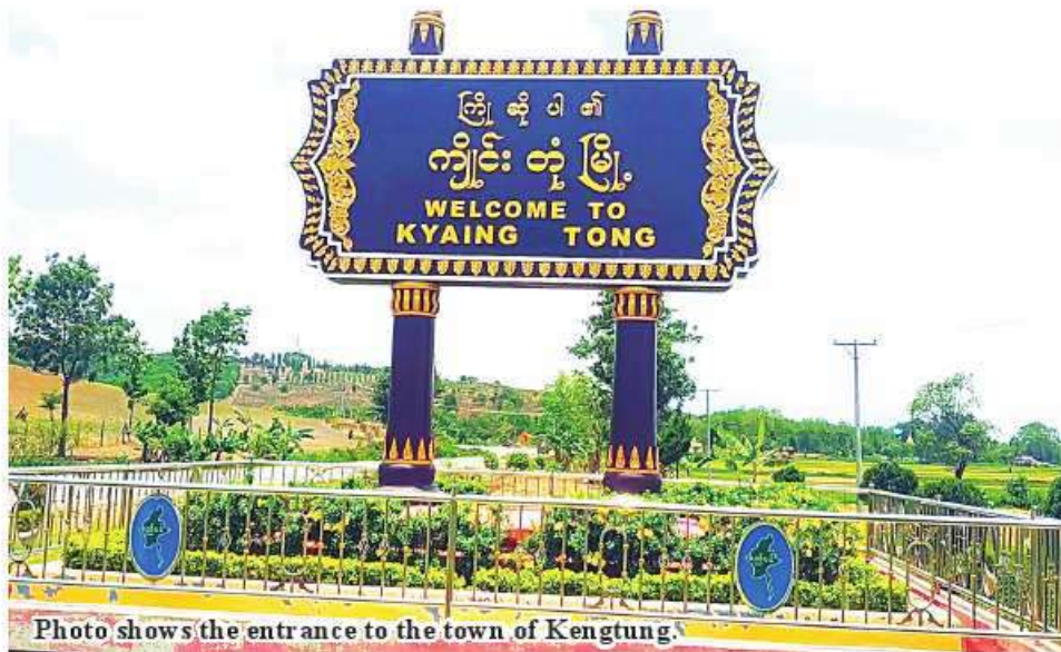
Photo shows the entrance to the town of Kengtung.

Kengtung May 14 2023-2024 FY, according to the Ministry of Commerce. The volume of trade from the Kengtung border trade station has increased year by year, reaching more than US$150 million in