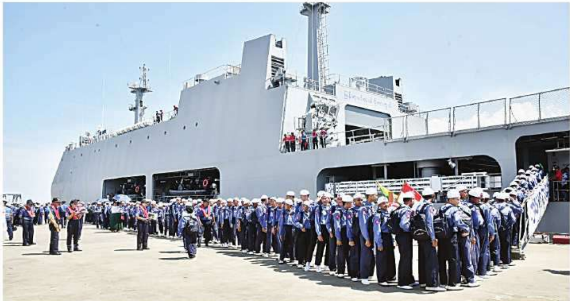
ရေကြောင်းလူငယ် သင်တန်းသား၊ သင်တန်းသူများ ရန်ကုန်မြစ်ကြောင်းတစ်လျှောက် လေ့လာရေးသွားရောက်ရန် တပ်မတော်(ရေ)မှ စစ်ရေယာဉ်(မုတ္တမ)ပေါ် တက်ရောက်စဉ်။