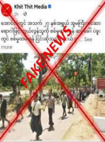
နေပြည်တော် မေ ၁၄

မကွေးတိုင်းဒေသကြီး အောင်လံမြို့ တရော်ကုန်းရပ်ကွက်မှ အမှုကြီးကင်ဆာ ရောဂါဖြင့် ကွယ်လွန်သည့် မြို့သား ခြောက်လ ခန့်ရှိပြီဖြစ်သည့် အသက် ၂၇ နှစ်အရွယ် ဖိုးသောကြီးမှာ စစ်မှုထမ်းဆောင်ရန်