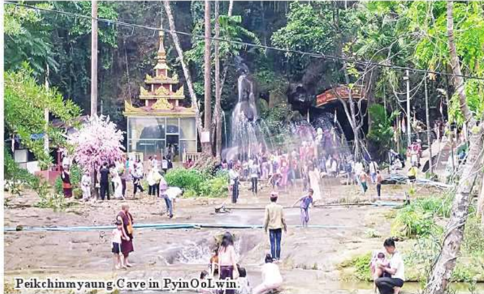
Peikchinmyaung Cave in PyinOoLwin.

PyinOoLwin May 14 Number of travellers to Peikchinmyaung Cave reaches more than 600 per day starting from the first