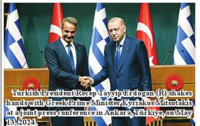
Turkish President Recep Tayyip Erdogan (R) shakes hands with Greek Prime Minister Kyriakos Mitsotakis at a joint press conference in Ankara, Türkiye, on May 13, 2024.