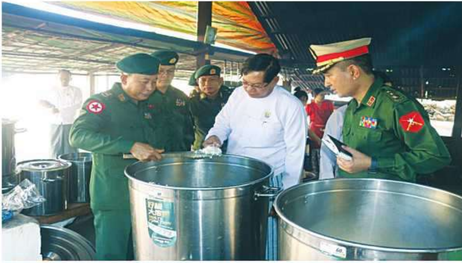
ရန်ကုန်တိုင်းဒေသကြီးဝန်ကြီးချုပ် ဦးဖိုးသိန်း ပြည်သူ့စစ်မှုထမ်းသင်တန်းအမှတ်စဉ်(၂) သင်တန်းသားများ စားသောက်ရေးအတွက် ပြင်ဆင်ထားရှိမှုကို ကြည့်ရှုစစ်ဆေးစဉ်။