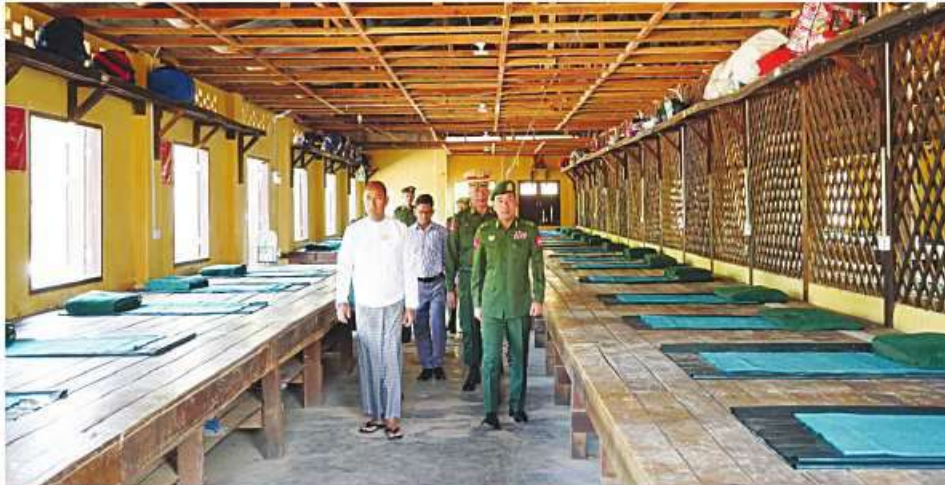
ရှမ်းပြည်နယ်ဝန်ကြီးချုပ် ဦးအောင်အောင်နှင့် တြိဂံဒေသတိုင်းစစ်ဌာနချုပ် တိုင်းမှူး ဝိုလ်ချုပ်အောင်ခိုင်ဝင်း ပြည်သူ့စစ်မှုထမ်းသင်တန်းအမှတ်စဉ်(၂) သင်တန်းသားများအတွက် အိပ်ဆောင်များ ပြင်ဆင်ဆောင်ရွက်ထားမှုကို ကြည့်ရှုစစ်ဆေးစဉ်။