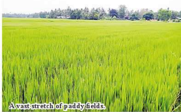
A vast stretch of paddy fields.

ers need to expand sown acreage of canola. Mustard can be grown in all places," he explained. Canola is planted in southern Shan State, northern Shan State, Kayin, Kayah and Chin states and upper Sagaing Region. These seeds flow into Mandalay market which distributes the canola seeds to other regions and states again. 185