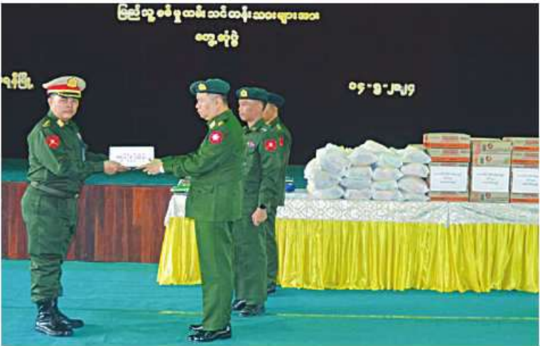
တောင်ပိုင်းတိုင်းစစ်ဌာနချုပ် တိုင်းမှူး ဝိုလ်ချုပ်ချုပ်ကြည်သိုက် ပြည်သူ့စစ်မှုထမ်းသင်တန်းအမှတ်စဉ်(၂) သင်တန်းသားများအတွက် ဂုဏ်ပြုချီးမြှင့်ငွေနှင့် စားသောက်ဖွယ်ရာများပေးအပ်စဉ်။

အရည်အချင်းကိုက်ညီသူ နိုင်ငံ့သားကောင်းများသည် သက်ဆိုင်ရာတိုင်းစစ်ဌာနချုပ် နယ်မြေများရှိ သင်တန်းကျောင်းအသီးသီးသို့ရောက်ရှိ၍ လိုအပ်သည်ကြိုတင်ပြင်ဆင်မှုများကို ဆောင်ရွက်ခဲ့ကြပြီးနောက် ယနေ့နံနက်ပိုင်းတွင် သက်ဆိုင်ရာတိုင်းစစ်ဌာနချုပ်များအလိုက် နယ်မြေခံသင်တန်းကျောင်းများအသီးသီးတွင် သင်တန်းဖွင့်ပွဲများ ပြုလုပ်ကြသည်။ အဆိုပါ သင်တန်းဖွင့်ပွဲများကို သက်ဆိုင်ရာ သင်တန်းကျောင်းအလိုက် ကျောင်းအုပ်ကြီးများက သင်တန်းဖွင့်အမှာစကားများပြောကြားခဲ့ပြီး တိုင်းဒေသကြီးနှင့် ပြည်နယ်ဝန်ကြီးချုပ်များ၊ တိုင်းမှူးများနှင့် တာဝန်ရှိသူများက ဖွင့်ပွဲများသို့ တက်ရောက် အားပေးချီးမြှင့်ကြကာ သင်တန်းသားများကိုရင်းရင်းနှီးနှီးလိုက်လံ