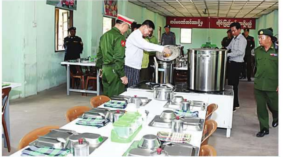
မန္တလေးတိုင်းဒေသကြီးဝန်ကြီးချုပ် ဦးမျိုးအောင် ပြည်သူ့စစ်မှုထမ်းသင်တန်းအမှတ်စဉ်(၂) သင်တန်းသားများအတွက် စီမံဆောင်ရွက်ထားသည့် စားရိပ်သာကို ကြည့်ရှုစစ်ဆေးစဉ်။