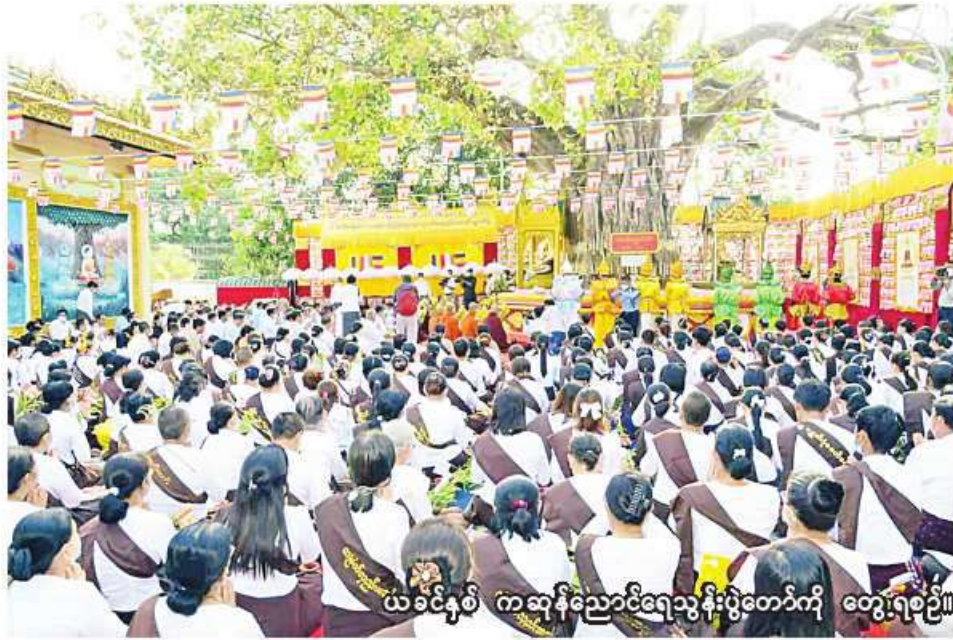
ယခင်နှစ် ကဆုန်ညောင်ရေသွန်းပွဲတော်ကို တွေ့ရစဉ်။

ရန်ကုန် မေ ၁၄ ရန်ကုန်တိုင်းဒေသကြီး ဒဂုံမြို့နယ်ရှိ ရွှေတိဂုံစေတီတော်တွင် မဟာဗောဓိ ကဆုန်ညောင်ရေသွန်းပွဲတော်ကို မေ ၂၂ ရက် (ကဆုန်လပြည့်နေ့) နံနက် ၇ နာရီမှစတင်ကာ စည်ကားသိုက်မြိုက်စွာကျင်းပ