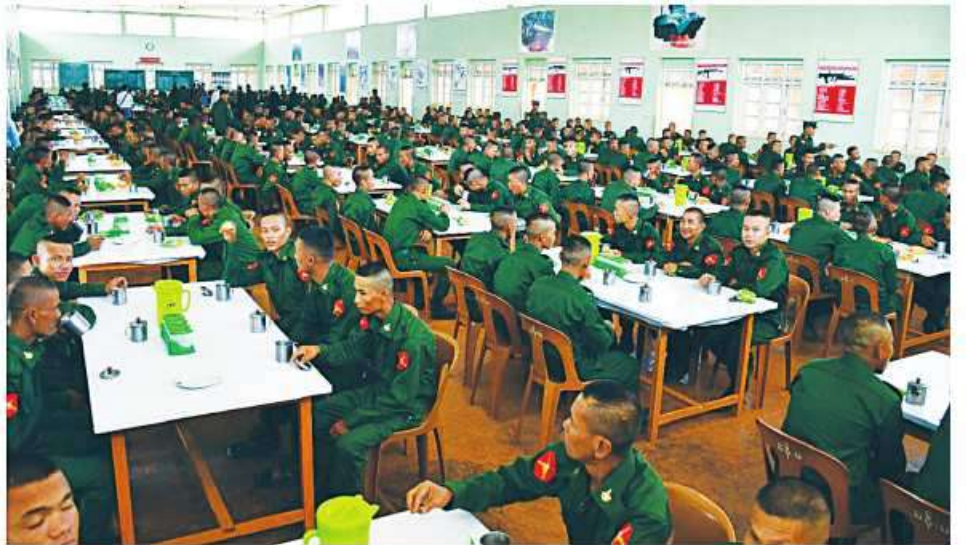
ရှမ်းပြည်နယ်အစိုးရအဖွဲ့မှ တာဝန်ရှိသူများက ပြည်သူ့စစ်မှုထမ်းသင်တန်းအမှတ်စဉ်(၂)မှ သင်တန်းသားများကို စားရိပ်သာတွင် ရင်းရင်းနှီးနှီးလိုက်လံနှုတ်ဆက်စဉ်။