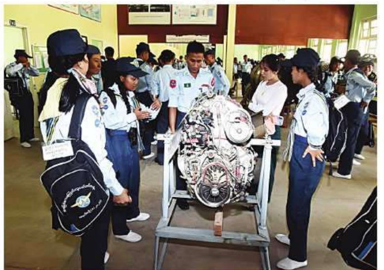
လေ့လာရေးခရီးစဉ်အဖြစ်လာရောက်သည့် လေကြောင်းလူငယ် သင်တန်းသား၊ သင်တန်းသူများအား တာဝန်ရှိသူများက လိုက်လံရှင်းလင်းပြသစဉ်။

ပျံသန်းခြင်းကို ဆောင်ရွက်ခဲ့ကြသည်။ ထို့နောက် နေ့လယ်ပိုင်းတွင် အဆိုပါ သင်တန်းစခန်း ရှစ်ခုမှ သင်တန်းသား၊ သင်တန်းသူများသည် RC လေယာဉ်၊ ရဟတ်ယာဉ် မောင်းပြိုင်ပွဲများကို ဝင်ရောက်ယှဉ်ပြိုင်ခဲ့ကြပြီး သင်တန်းသား များ၊ အုပ်ချုပ်သူနည်းပြများ ဆရာ၊ ဆရာမများနှင့် တာဝန်ရှိသူများက ယှဉ်ပြိုင် နေမှုများကို အားပေးကြည့်ရှုခဲ့ကြသည်။ အလားတူ ကျန်သင်တန်းစခန်း ကိုးခုမှ သင်တန်းသား၊ သင်တန်းသူ၊ နည်းပြ၊ အုပ်ချုပ်သူများသည် လေ့လာရေးခရီးစဉ် အဖြစ် ယနေ့နံနက်ပိုင်းတွင် မြန်မာနိုင်ငံ လေကြောင်းနှင့် အာကာသပညာတက္ကသိုလ် မြေပြင်အတတ်သင် လေတပ်စခန်းဌာနချုပ် ရှိ စက်မှုလက်မှုအတတ်သင်ကျောင်း တို့ကိုလည်းကောင်း၊ နေ့လယ်ပိုင်းတွင် လေကြောင်းအတတ်သင် လေတပ်စခန်း ဌာနချုပ်ရှိ လေယာဉ်မောင်းသင်ကျောင်း နှင့် Aeromedical Centre တို့ကို လည်းကောင်း အသီးသီးလေ့လာခဲ့ကြရာ တာဝန်ရှိသူများက လိုက်လံရှင်းလင်းပြသခဲ့ ကြောင်း သတင်းရရှိသည်။