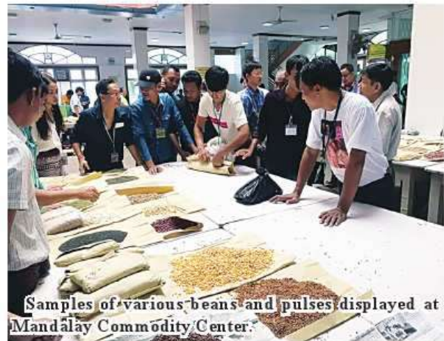
Samples of various beans and pulses displayed at Mandalay Commodity Center.

The commodity centre is open from 8 am to 4 pm daily for convenience of businesspersons in trading beans, maize and sesame. 184