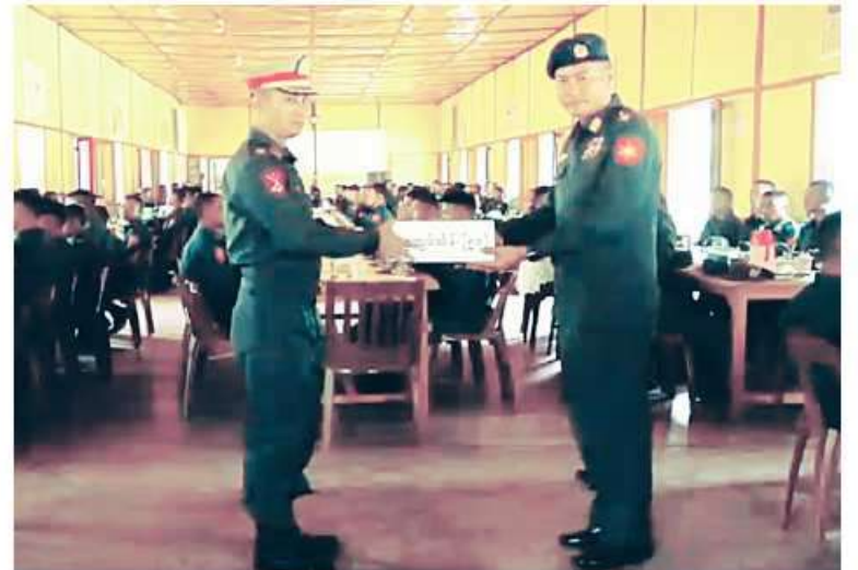
အရှေ့မြောက်တိုင်းစစ်ဌာနချုပ် တိုင်းမှူး ဝိုလ်ချုပ်နိုးတင် ပြည်သူ့စစ်မှုထမ်းသင်တန်းအမှတ်စဉ်(၂) သင်တန်းသားများကို ဂုဏ်ပြုချီးမြှင့်ငွေများ ပေးအပ်စဉ်။

နှုတ်ဆက်ကြသည်။ တိုင်းမှူးများနှင့် တာဝန်ရှိသူများသည် သင်တန်းဖွင့်ပွဲများအပြီးတွင် တိုင်းဒေသ သင်တန်းကျောင်းခန်းမများ၌ ပြည်သူ့စစ်မှုထမ်းသင်တန်း အမှတ်စဉ်(၂)မှ