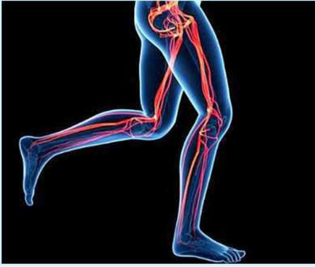
မိမိတို့ရဲ့ ခန္ဓာကိုယ်မှာ ကြွက်သားတွေကလည်း ပိုမို အဆီပိုတွေ မရှိတော့ဘူးဆိုရင် ပေါ်လွင်လာပြီး သန်မာလာမှာ

ဖြစ်ပါတယ်။ ဒီလို ဖြစ်ချင်တယ်ဆိုရင် တော့ တစ်ရက်ကို ခြေလှမ်းရေ ၁၀၀၀၀ လောက် လမ်းလျှောက် ပေးရုံနဲ့တင် ရရှိနိုင်ပါတယ်။ ဒီထက်ပိုပြီး ပြင်းထန်တဲ့ လေ့ကျင့်ခန်းမျိုးလိုချင်တယ်ဆို ရင်တော့ တောင်တက်လမ်း လျှောက်ခြင်းကိုလည်း ကြိုးစား ကြည့်သင့်ပါတယ်။ ဒါ့အပြင် စက္ကန့် ၃၀ မှ ၁ မိနစ် ၂ မိနစ်အထိ ခပ်မြန်မြန်လမ်း လျှောက်ပြီး ပုံမှန်လမ်းပြန် လျှောက်ခြင်း၊ အဲဒီနောက် ခပ် မြန်မြန်ပြန်ပြီး လမ်းလျှောက်ခြင်း လိုမျိုး လေ့ကျင့်ခန်းတွေကလည်း ထိရောက်မှုရှိလှပါတယ်။ လမ်းလျှောက်ခြင်းဟာ သင့် ခန္ဓာကိုယ်တစ်လျှောက်မှာရှိတဲ့ ကြွက်သားတွေရဲ့ တင်းအားကို တိုးမြှင့်စေတာသာဖြစ်ပါတယ်။ လမ်းလျှောက်ခြင်းဟာ ပြင်း ထန်တဲ့ လေ့ကျင့်ခန်းမဟုတ်တဲ့ အတွက် ကြွက်သားတွေနာကျင် ခြင်းမရှိစေပါဘူး။ ဒါကြောင့် အနာတရဖြစ်တာမျိုး၊ နောက် တစ်ခေါက် လမ်းလျှောက်ဖို့ အတွက် ကြွက်သားတွေနာလို့ မလျှောက်နိုင်တာမျိုးလည်း မဖြစ် စေပါဘူး။