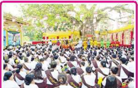
ရွှေတိဂုံစေတီတော်တွင် မဟာဗောဓိကဆုန် ညောင်ရေသွန်းပွဲတော် စည်ကားသိုက်မြိုက်စွာကျင်းပပြုလုပ်သွားမည်

နေပြည်တော် မေ ၁၄ နိုင်ငံသားတိုင်းသည် ပြည်ထောင်စုမပြိုကွဲရေး၊ တိုင်းရင်းသားစည်းလုံးညီညွတ်မှု မပြိုကွဲရေးနှင့် အချုပ်အခြာအာဏာတည်တံ့ခိုင်မြဲရေး ဟူသည့် ဒို့တာဝန်အရေးသုံးပါးကို ထိန်းသိမ်းစောင့်ရှောက်ရန် တာဝန်ရှိကြသဖြင့် ယင်းတာဝန်များကို ထမ်းဆောင်ရန်အတွက် စစ်ပညာသင်ကြားရန်နှင့် နိုင်ငံတော်ကာကွယ်ရေးအတွက် စစ်မှုထမ်းဆောင်နိုင်ရန် ရည်ရွယ်၍ ပြည်သူ့စစ်မှုထမ်းဥပဒေကို ၂၀၁၀ ပြည့်နှစ် နိုဝင်ဘာလတွင် ဥပဒေအမှတ် (၂၇/၂၀၁၀)ဖြင့် ပြဋ္ဌာန်းခဲ့ပြီး ၂၀၂၄ ခုနှစ် ဖေဖော်ဝါရီ ၁၀ရက်တွင် စတင်အာဏာသက်ဝင်စေခဲ့ကာ ပြည်သူ့စစ်မှုထမ်းသင်တန်းအမှတ်စဉ် (၁)ကို တိုင်းဒေသကြီးနှင့် ပြည်နယ်အသီးသီး၌ အောင်မြင်စွာဖွင့်လှစ်သင်ကြားပေးလျက်ရှိသည်။ ဆက်လက်၍ ပြည်သူ့စစ်မှုထမ်းသင်တန်းအမှတ်စဉ်(၂)တွင် ပါဝင်တက်ရောက်ကြမည့် စာမျက်နှာ ၁၈ ကော်လံ ၁၂