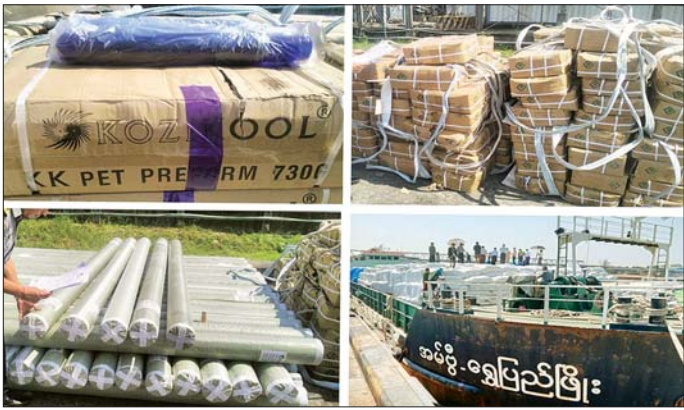
ရန်ကုန်တိုင်းဒေသကြီး၊ ရွှေမိဆိပ်ကမ်း၌ ဖမ်းဆီးရမိမှု။

နေပြည်တော် ဖေဖော်ဝါရီ ၂၅ တရားမဝင် ကုန်သွယ်မှုတိုက်ဖျက်ရေးဦးဆောင်ကော်မတီ၏ ကြီးကြပ်ကွပ်ကဲမှုဖြင့် တရားမဝင်ကုန်သွယ်မှုများကို ဥပဒေနှင့်အညီ ထိရောက်စွာ တားဆီးအရေးယူနိုင်ရေး ဆောင်ရွက်လျက်ရှိသည်။ အကောက်ခွန်ဦးစီးဌာန၏ စီမံခန့်ခွဲမှုဖြင့် တာဝန်ကျပူးပေါင်းအဖွဲ့များက စစ်ဆေးမှုများ ဆောင်ရွက်ခဲ့ရာ ဖေဖော်ဝါရီ ၂၁ ရက်နှင့် ၂၂ ရက်တို့တွင် အေးရှားဝေါင်ကုန်သေတ္တာစစ်ဆေးရေးစခန်း၌ ကုန်သေတ္တာ ခုနစ်လုံးအတွင်းမှ တရားဝင်စာရွက်စာတမ်းအထောက်အထား တင်ပြနိုင်ခြင်းမရှိသည့် လုပ်ငန်းသုံးပစ္စည်း ၂၁ မျိုး၊ လူသုံးကုန်ပစ္စည်း ကိုးမျိုး (ခန့်မှန်းတန်ဖိုးငွေကျပ် ၅၂၅၀၄၂၀) ကို လည်းကောင်း၊ ဖေဖော်ဝါရီ ၂၄ ရက်တွင် ရွှေမိဆိပ်ကမ်း၌ ကော့သောင်းမြို့မှ ရန်ကုန်မြို့သို့ ဆိုက်ကပ်လာသော ရေယာဉ်တစ်စင်းပေါ်မှ တရားဝင်စာရွက်စာတမ်းအထောက်အထား တင်ပြနိုင်ခြင်းမရှိသည့် လုပ်ငန်းသုံးပစ္စည်း လေးမျိုး (ခန့်မှန်းတန်ဖိုးငွေကျပ် ၁၂၀၆၈၇၈၀) နှင့် အဆိုပါပစ္စည်းများ တင်ဆောင်လာသည့် MV. Shwe Pyi Phyo ရေယာဉ်တစ်စင်း (ခန့်မှန်းတန်ဖိုးငွေကျပ် ၂၅၀၀၀၀၀၀) ကိုလည်းကောင်း စုစုပေါင်း ခန့်မှန်းတန်ဖိုးငွေကျပ် ၂၅၀၇၅၆၆၀၀၀)ကို ဖမ်းဆီးရမိခဲ့ပြီး အကောက်ခွန်လုပ်ထုံးလုပ်နည်းများနှင့်အညီ အရေးယူဆောင်ရွက်လျက်ရှိသည်။ ထို့ပြင် ဖေဖော်ဝါရီ ၂၄ ရက်တွင် ကချင်ပြည်နယ် တရားမဝင်ကုန်သွယ်မှုတိုက်ဖျက်ရေး အထူးအဖွဲ့၏ စီမံခန့်ခွဲမှုဖြင့် တာဝန်ကျပူးပေါင်းအဖွဲ့က စစ်ဆေးမှုများ ဆောင်ရွက်ခဲ့ရာ နမ့်တီးမြို့၊ မြို့အဝင်ဆိုင်ဘုတ်အနီး၌ မိုးကောင်းမြို့မှ မြစ်ခြံနားမြို့သို့ မောင်းနှင်လာသော မော်တော်ယာဉ်လေးစီးနှင့် မော်တော်ဆိုင်ကယ်သုံးစီးတို့ဖြင့် သယ်ဆောင်လာသည့် တရားမဝင် စက်သုံးဆီဒီဇယ် ၇၅၈ ဂါလန်၊ ဓာတ်ဆီ ၇၂၂