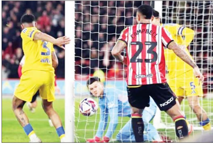
ရှက်ဖီးလ်အသင်းနှင့် လိဒ်စ်အသင်းတို့ ယှဉ်ပြိုင်ကစားမှုကို တွေ့ရစဉ်။

ချန်ပီယံရှစ်အမှတ်ပေးပြိုင်ပွဲ ပွဲစဉ် (၃၄) မှ ရှက်ဖီးလ်နှင့် လိဒ်စ်အသင်း ပွဲစဉ်ကို ဖေဖော်ဝါရီ ၂၅ ရက် နံနက် ၂ နာရီခွဲက ယှဉ်ပြိုင်ကစားခဲ့ရာ လိဒ်စ်အသင်းက သုံးဂိုး - တစ်ဂိုးဖြင့် နိုင်ပွဲရပြီး အမှတ်ပေးဇယားကို ငါးမှတ်ပြတ် ဦးဆောင်နိုင်ခဲ့သည်။