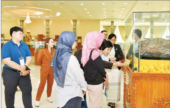
အာဆီယံအဖွဲ့ဝင်နိုင်ငံများမှ ကိုယ်စားလှယ်များ မြန်မာ့ကျောက်မျက်ရတနာပြတိုက်သို့ ခင်းကျင်းပြသထား သည့် မြန်မာ့တွင်းထွက်ရတနာများကို လေ့လာကြည့်ရှုစဉ်။