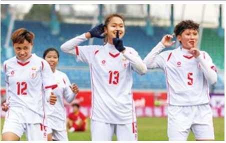
နီပေါ လေးနိုင်ငံဖိတ်ခေါ်ပြိုင်ပွဲ ဗိုလ်လုပွဲ မြန်မာ့လက်ရွေးစင်အမျိုးသမီးအသင်းကို တွေ့ရစဉ်။

(နိုင်ငံတော်စီမံအုပ်ချုပ်ရေးကောင်စီဥက္ကဋ္ဌ နိုင်ငံတော်ဝန်ကြီးချုပ်ဗိုလ်ချုပ်မှူးကြီးမင်းအောင်လှိုင်၏ ၂၀၂၄ ခုနှစ်၊ ဇူလိုင်လ ၅ ရက်နေ့တွင် ပြုလုပ်သော ပြည်ထောင်စုအစိုးရအဖွဲ့ အစည်းအဝေးအမှတ်စဉ် (၅/၂၀၂၄) သို့ တက်ရောက်အမှာစကားပြောကြားမှုမှ ကောက်နုတ်ချက်)