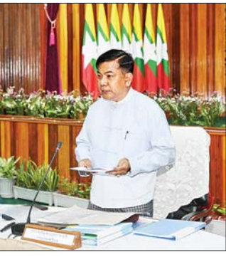
နိုင်ငံတော်စီမံအုပ်ချုပ်ရေးကောင်စီအဖွဲ့ဝင် ဒုတိယဝန်ကြီးချုပ်နှင့် ကာကွယ်ရေးဝန်ကြီးဌာန ပြည်ထောင်စုဝန်ကြီး ဗိုလ်ချုပ်ကြီး မောင်မောင်အေး အမျိုးသားမြေအသုံးချမှု ကောင်စီ သတ္တမအကြိမ် အစည်းအဝေးတွင် အမှာစကားပြောကြားစဉ်။

အစည်းအဝေးသို့အမျိုးသားမြေအသုံး ချမှုကောင်စီ ဒုတိယဥက္ကဋ္ဌ ပြည်ထောင်စု ဝန်ကြီးဌာန ပြည်ထောင်စုဝန်ကြီး ဒုတိယ ဗိုလ်ချုပ်ကြီး ထွန်းထွန်းနောင်၊ အဖွဲ့ဝင် ပြည်ထောင်စုဝန်ကြီးများ ဖြစ်ကြသည့် ဦးမောင်မောင်တင့်၊ ဒေါက်တာဝင်းဝင်း၊ ဒေါက်တာသီတာဦး၊ ဦးမင်းနောင်၊ ဦးခင်မောင်ရီ၊ ဦးညွှတ်ထွန်း၊ ဦးမျိုးသန့်၊ ဦး၊ ဒုတိယဝန်ကြီးများ၊ အမျိုးသား မြေအသုံးချမှုကောင်စီ အထောက်အကူပြု လုပ်ငန်းကော်မတီများမှ ဥက္ကဋ္ဌများ၊ ဌာနဆိုင်ရာအကြီးအကဲများနှင့် တာဝန်ရှိ သူများ တက်ရောက်ကြပြီး အမျိုးသား မြေအသုံးချမှုကောင်စီဝင် တိုင်းဒေသကြီး နှင့် ပြည်နယ်ဝန်ကြီးချုပ်များက ဗီစီယို ကုန်ဖရင့်ဖြင့် တက်ရောက်ကြသည်။