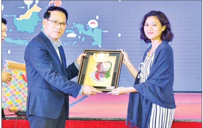
ပြည်ထောင်စုဝန်ကြီး ဦးမောင်မောင်အုန်း အာဆီယံအဖွဲ့ဝင်နိုင်ငံများမှ ကိုယ်စားလှယ်များအား အမှတ်တရလက်ဆောင်ပစ္စည်းများ ပေးအပ်စဉ်။

ဦးစွာ “အာဆီယံပြန်ကြားရေးကဏ္ဍနှင့် မြန်မာ နိုင်ငံတော်မီဒီယာ” Video Clip ကို ဖွင့်လှစ်ပြသ သည်။ ပိုမိုခိုင်မာသောလူမှုအသိုင်းအဝိုင်းများတည်ဆောက် ထိရောက်စွာ ပြည်ထောင်စုဝန်ကြီး ဦးမောင်မောင် အုန်းက အစိုးရ၏ ဆက်သွယ်ညှိနှိုင်းပြောဆိုရေး ကဏ္ဍတွင် အဆင့်အသွေးနှင့်ထိရောက်မှုကို မြှင့်တင် ရန် တူညီသော ကတိကဝတ်များဖြင့် စည်းလုံး ညီညွတ်စွာဖြင့် အာဆီယံဒေသအတွင်းရှိ လုပ်ဖော် ကိုင်ဖက်များအားလုံး ယခုနေရာတွင် တစ်စုတစ်ဝေး