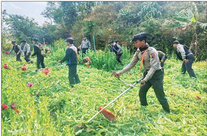
လွိုင်လင်မြို့နယ်၌ ဘိန်းခင်းဖျက်ဆီးနေမှုကို တွေ့ရစဉ်။

နေပြည်တော် ဖေဖော်ဝါရီ ၂၅ ရမ်းပြည်နယ် (တောင်ပိုင်း) လွိုင်လင်မြို့နယ်၌ ဖေဖော်ဝါရီ ၂၄ ရက်က ရဲတပ်ဖွဲ့ဝင်များ၊ နယ်မြေခံ တပ်မတော်သားများ ပါဝင်သော ပူးပေါင်းအဖွဲ့မှ ဘိန်းခင်း ဖျက်ဆီးခြင်းများ ဆောင်ရွက်ခဲ့ကြောင်း သိရသည်။ လွိုင်လင်ခရိုင် ရဲတပ်ဖွဲ့မှ တပ်ဖွဲ့ဝင်များ၊ နယ်မြေခံ တပ်မတော်သားများ ပါဝင်သော ပူးပေါင်းအဖွဲ့သည် ဖေဖော်ဝါရီ ၂၄ ရက် နံနက် ၉ နာရီခွဲတွင် လွိုင်လင်မြို့နယ် ပန်မုန့်ကျေးရွာ အုပ်စု ပန်မုန့်ကျေးရွာ၏ အရှေ့မြောက်ဘက် နှစ်မိုင်ခန့် အကွာရှိ စာမျက်နှာ ၁၃ ကော်လံ ၁ □