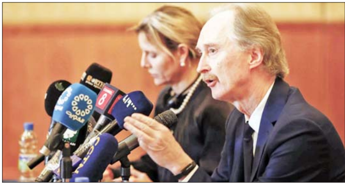
ဟောင်းဖြစ်ခဲ့သော အာမက်အယ်လ်ရှာရာကို ဆီးရီးယားလွန်ခဲ့သော သီတင်းပတ်များအတွင်း ဆီးရီးယားယားကြားဖြတ်သမ္မတအဖြစ် အမည်စာရင်းတင်သွင်းနိုင်ငံရွှေ့ရေးအတွက် နိုင်ငံအနှံ့ နိုင်ငံရေးဆွေးနွေးပွဲ ခဲ့ကြသည်။ အေပီ

ဆီးရီးယားနိုင်ငံအပေါ် ချမှတ်ထားသော အရေးယူပိတ်ဆို့မှုများကို ဖယ်ရှားပေးရာတွင် အကူအညီဖြစ်စေလိမ့်မည်ဖြစ်ကြောင်း ဒဏ်ခတ်စက်ခရီးစဉ်အတွင်း ဆီးရီးယားနိုင်ငံဆိုင်ရာ ကုလသမဂ္ဂအထူးကိုယ်စားလှယ် ဂီယာဝီတာဆန် (ယာပုံ) က ပြောကြားလိုက်သည်။ အာဆက်အစိုးရ ဒီဇင်ဘာလတွင် ပြုတ်ကျပြီးနောက် ဆီးရီးယားနိုင်ငံကို ယခုအခါတွင် ဟာရက်တာရာအယ်ရှန်အုပ်စု (အိတ်ချ်တီအက်စ်) က ထိန်းချုပ်လျက်ရှိသည်။ လက်ရှိဆီးရီးယားအစိုးရက မတ်လတွင် အစိုးရသစ်တစ်ရပ်ကို ဖွဲ့စည်းသွားမည်ဖြစ်ကြောင်း ပြောကြားခဲ့သည်။ ဇန်နဝါရီလတွင် အိတ်ချ်တီအက်စ်ခေါင်းဆောင်