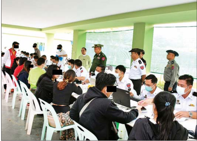
ထိန်းသိမ်းထားသည့် ပြည်ပနိုင်ငံသားများကို သက်ဆိုင်ရာနိုင်ငံများသို့ အမြန်ဆုံးပြန်လည်လွှဲပြောင်းပေးနိုင်ရေး လိုအပ်သည့်ကိစ္စရပ်အချက်အလက်များနှင့် မှတ်တမ်းများ စာရင်းကောက်ယူခြင်းလုပ်ငန်း ဆောင်ရွက်နေမှုကို တွေ့ရစဉ်။