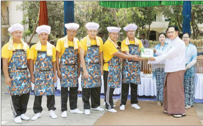
ပြည်ထောင်စုဝန်ကြီးဦးမောင်မောင်အုန်း ပထမဆုရရှိသည့် ဝန်ကြီးရုံး ထမန်းအသင်းအား ဆုပေးအပ်ချီးမြှင့်စဉ်။

နေပြည်တော် ဖေဖော်ဝါရီ ၂၅ မြန်မာ့ဓလေ့ရိုးရာ ယဉ်ကျေးမှုအစဉ်အလာကို ထိန်းသိမ်းစောင့်ရှောက်တတ်စေရန်၊ ဝန်ထမ်းများ အချင်းချင်းရုံးလုပ်ငန်းများ ဆောင်ရွက်ရာတွင် အပြန်အလှန် ညီညွတ်မှုတရားဖြင့် အသင်းအဖွဲ့စိတ်ဓာတ်ကို အရင်းခံပြီး စည်းစည်းလုံးလုံး ညီညွတ်ညွတ်ပိုင်ဝန်းကြီးပမ်းဆောင်ရွက်တတ်စေရန်၊ တစ်ဦးနှင့် တစ်ဦး အပြန်အလှန် ချစ်ကြည်ရင်းနှီးမှုနှင့် ပျော်ရွှင်မှု တို့ကိုရရှိစေရန် ရည်ရွယ်ချက်များဖြင့် ပြန်ကြားရေးဝန်ကြီးဌာန၏ မြန်မာ့ရိုးရာထမန်းထိုးပြိုင်ပွဲကို ယနေ့နံနက်ပိုင်းတွင် နေပြည်တော်ရှိ ပြန်ကြားရေးဝန်ကြီးဌာန ယာဉ်ရပ်နားဝင်း၌ စည်ကားသိုက်မြိုက်စွာ ကျင်းပသည်။