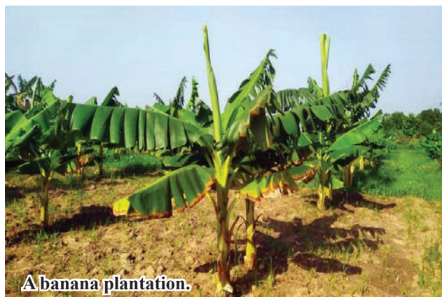
A banana plantation.

In 2024-25 monsoon season, Mawlaik District earmarked 155 acres of banana plants in Mawlaik Township and 490 acres in Phaungpyin Township,