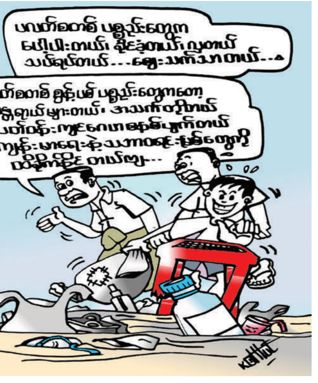
ဟယ်ဝဲတစ် ပဉ္စည်းကျော ပေါ့ပါးတယ်၊ ချိန်ခွဲတယ်၊ လှတယ် သပ်ချင်တယ်... ဈေးသက်သာတယ်... ဟယ်ဝဲတစ် ခွက်ပစ် ပဉ္စည်းကျော အန္တရာယ်များတယ်၊ အသက်တိုတယ် ပတ်ဝန်းကျင်ပျက်စီးမှုကိုတယ် ကျွန်းမာရေးနဲ့ သာကာရေးနဲ့ပစ်တွေကို ပိတ်ပင်ဖို့ တယ်ဗျ...

သာသာမြေပြင်ပြုလုပ်သုံးစွဲနည်းပညာ ပေးခြင်း၊ နွေသီးနှံများ အချိန်မီ စိုက်ပျိုးနိုင် ရန် နည်းပညာပေးခြင်းလုပ်ငန်းများ ဆောင်ရွက်ပေးခဲ့ကြောင်း သိရသည်။ တောင်သူများအနေဖြင့် နွေစပါးနှင့် အခြားသီးနှံများ အချိန်မီစိုက်ပျိုးနိုင်ရေး အတွက် စိုက်ပျိုးရေးဦးစီးဌာနက ထုတ် ပြန်ထားသည့်သီးနှံပိုးမွှားရောဂါကြိုတင် ကာကွယ်ရေးဆိုင်ရာ ညွှန်ကြားချက်များ၊ မြေဆီလွှာအာဟာရဖြည့်တင်းရေးဆိုင်ရာ လုပ်ငန်းများနှင့် မျိုးကောင်းမျိုးသန့် များ ကြိုတင်စုဆောင်းရေးဆိုင်ရာလုပ် ငန်းများကို စိုက်ပျိုးရေးဦးစီးဌာနနှင့်ချိတ် ဆက်၍ ကြိုတင်ပြင်ဆင်ထားကြောင်း သိရသည်။ (၂၀၆)