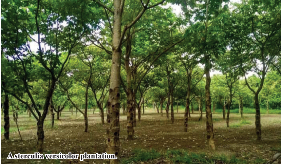
Asterculia versicolor plantation.

Sagaing August 15 According to the statistics of Sagaing District Agriculture Department, a total of 2,694 acres of Sterculia versicolor plants have been grown in Sagaing District of Sagaing Region.