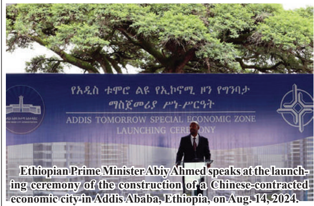
Ethiopian Prime Minister Abiy Ahmed speaks at the launching ceremony of the construction of a Chinese-contracted economic city in Addis Ababa, Ethiopia, on Aug. 14, 2024.