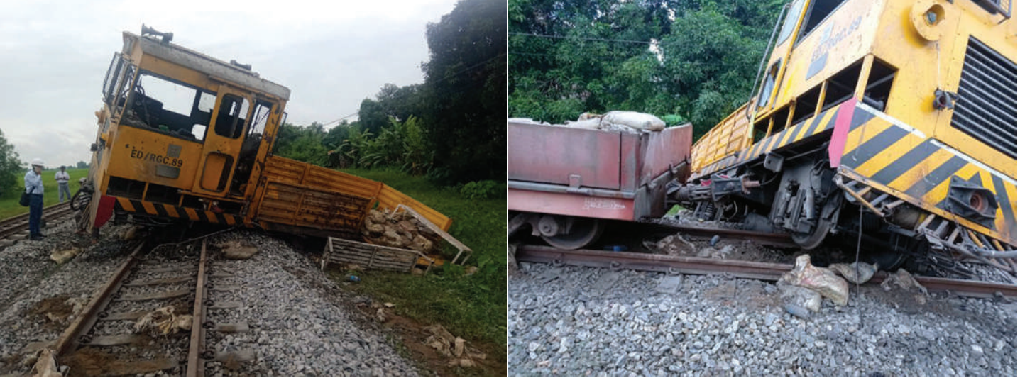
ရန်ကုန်-မန္တလေးရထားလမ်းပိုင်းအတွင်း ဖြူးမြို့နယ် ညောင်ပင်သာနှင့် ဖြူးဘူတာကြား မိုင်းပေါက်ကွဲမှုကြောင့် လုံခြုံရေးကင်းလှည့် သံလမ်းပြေးယာဉ် (RGC-89) လမ်းချော်ကျမှုကို တွေ့ရစဉ်။

နေပြည်တော် ဩဂုတ် ၁၅ ယနေ့နံနက် ၁ နာရီခန့်တွင် ရန်ကုန်-မန္တလေး ရထားလမ်းပိုင်းအတွင်း ဖြူးမြို့နယ် ညောင်ပင်သာ ဘူတာမှ လုံခြုံရေးကင်းလှည့်ထွက်ခွာလာသည့် သံလမ်းပြေးယာဉ်(RGC-89)သည် နံနက် ၁ နာရီ ၁၅ မိနစ်ခန့်တွင် ညောင်ပင်သာနှင့် ဖြူးဘူတာကြား အဆန်လမ်း မိုင်တိုင်အမှတ်(၁၃၂) ကြေးနန်းတိုင် အမှတ် ၅ နှင့် ၆ ကြား၌ ဖြတ်သန်းစဉ် အကြမ်းဖက် သောင်းကျန်းသူအဖွဲ့က Remote မိုင်းဖြင့် ဖောက်ခွဲခဲ့ သဖြင့် သံလမ်းပြေးယာဉ်(RGC-89) လမ်းချော်ကျမှု ဖြစ်ပွားခဲ့ခြင်းကြောင့် လူစီးရထားနှင့်ကုန်ရထားများ ကြန့်ကြာမှုဖြစ်ပေါ်ခဲ့ကြောင်း သိရသည်။ မိုင်းပေါက်ကွဲမှုဖြစ်စဉ်ဖြစ်ပွားရာနေရာသို့ နယ် မြေဒေသ တာဝန်ရှိသူများ၊ နယ်မြေခံလုံခြုံရေးတပ်ဖွဲ့ ဝင်တို့က အချိန်နှင့်တစ်ပြေးညီရောက်ရှိပြီး နယ်မြေ ရှင်းလင်းစစ်ဆေးခြင်း၊ မြန်မာ့စီးရထားဝန်ထမ်းများ ကလည်း လမ်းချော်ကျသော သံလမ်းပြေးယာဉ်အား မတင်၍ စာမျက်နှာ ၂၁ ကော်လံ ၁ ပ။