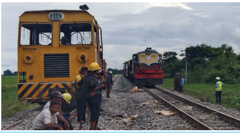
ညောင်ပင်သာနှင့် ဖြူးဘူတာကြား မိုင်းပေါက်ကွဲမှုကြောင့် ရထားလမ်းပျက်စီးမှုအား ပြန်လည်ပြုပြင်ပြီးစီး၍ ရထားများပုံမှန်အတိုင်း ပြန်လည်ဖြတ်သန်းနေစဉ်။

အကြမ်းဖက် သောင်းကျန်းသူများ အနေဖြင့် နိုင်ငံတော်ပိုင်ရထားစက်ခေါင်းနှင့် တွဲများ၊ ရထားလမ်းနှင့် တံတားများ၊ ခရီးသည်များနှင့် ကုန်စည်များ ထိခိုက်ပျက်စီးဆုံးရှုံးစေရေး၊ ရထားစီးခရီးသွားပြည်သူများအနေဖြင့် ရထားဖြင့် ခရီးသွားလာရာတွင် ကိုယ်စိတ်နှလုံး ချမ်းမြေ့ပြီး အသက်အန္တရာယ်ကင်းရှင်းစွာဖြင့် လုံခြုံစိတ်ချစွာသွားလာနိုင်မှု မရှိစေရေးနှင့် ရန်ကုန်-မန္တလေး ရထားလမ်းအဆင့်မြင့်တင်ရေးစီမံကိန်း နှောင့်နှေးကြန့်ကြာစေရန်အတွက် ရည်ရွယ်ပြီး ယခုကဲ့သို့အကြိမ်ကြိမ် ကျူးလွန်ဖျက်ဆီးနေကြခြင်းဖြစ်သော်လည်း နိုင်ငံတော်အစိုးရအနေဖြင့် အများပြည်သူခရီးသွားလာမှုနှင့်ကုန်စည်ပို့ဆောင်မှုအဆင်ပြေချောမွေ့မြန်ဆန်စေရေးအတွက် ရထားလမ်းနှင့် အခြေခံအဆောက်အအုံများ ပိုမိုတိုးတက်ကောင်းမွန်လာစေရေး၊ ရထားပို့ဆောင်ရေးစနစ်အဆင့်မြင့်တင်ရေးစီမံကိန်းလုပ်ငန်းများကို ရည်မှန်းချက်ထားရှိ၍ အစဉ်တစိုက်အလေးထား စီမံဆောင်ရွက်ပေးလျက်ရှိကြောင်း သတင်းရရှိသည်။ (၅၀၁)