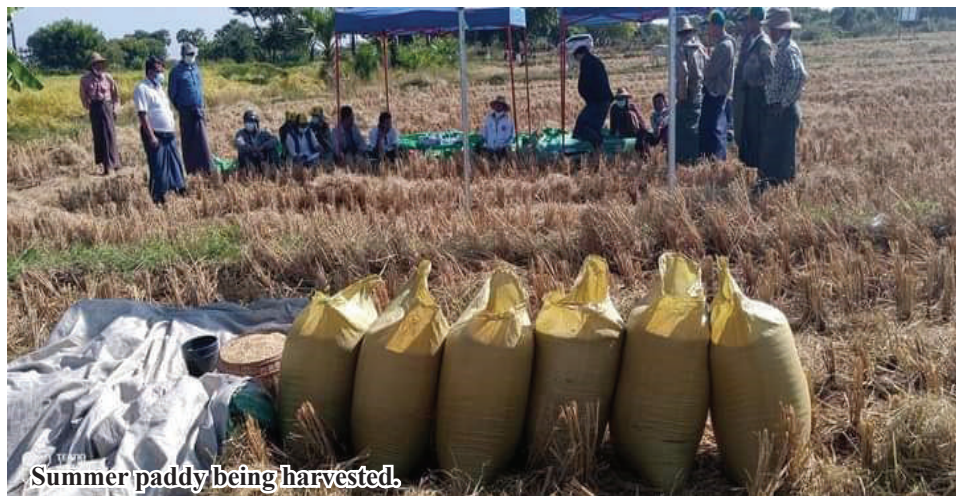
Summer paddy being harvested.