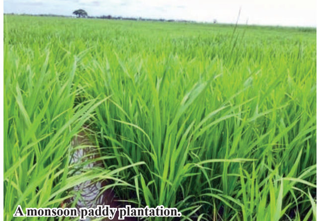
A monsoon paddy plantation.