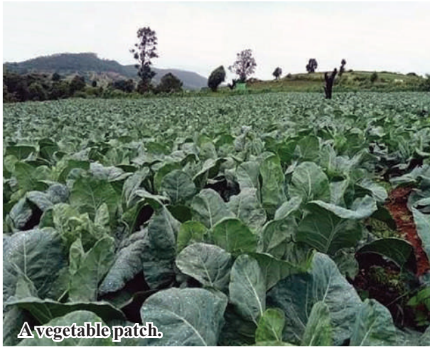
A vegetable patch.