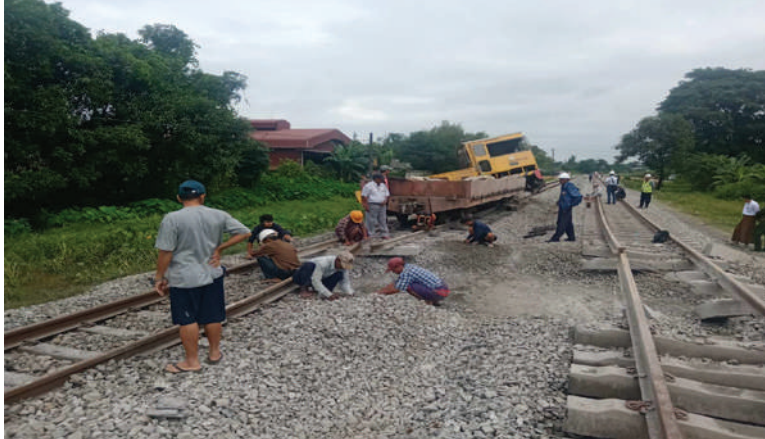
ညောင်ပင်သာနှင့် ဖြူးဘူတာကြား မိုင်းပေါက်ကွဲမှုကြောင့် ရထားလမ်းပျက်စီးမှုအား ဝန်ထမ်းများ ပြန်လည်ပြုပြင်နေမှုကို တွေ့ရစဉ်။