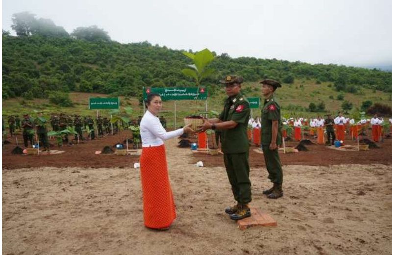
ကြိတ်ဒေသတိုင်းစစ်ဌာနချုပ်၌ ၂၀၂၆ ခုနှစ် ဒုတိယအကြိမ် မိုးရာသီသစ်ပင်စိုက်ပျိုးပွဲ ကျင်းပစဉ်။