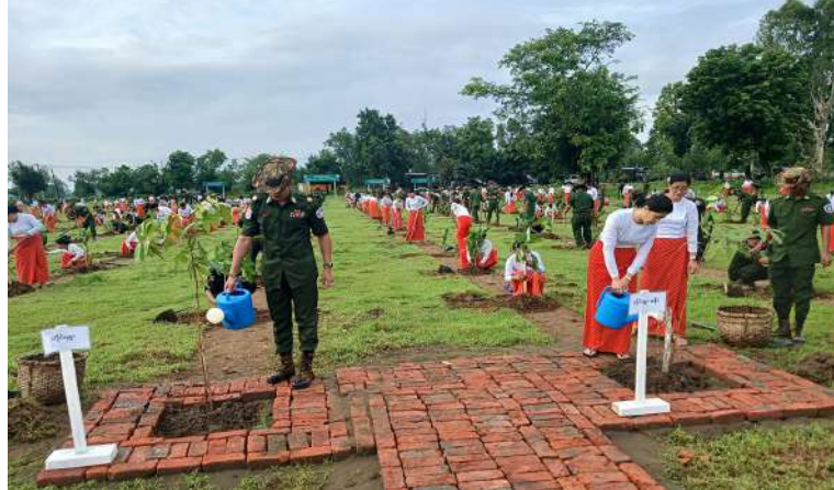
အနောက်ပိုင်း တိုင်းစစ်ဌာနချုပ် ၂၀၂၆ ခုနှစ် ဒုတိယအကြိမ် မိုးရာသီ သစ်ပင် စိုက်ပျိုးပွဲ ကျင်းပစဉ်။