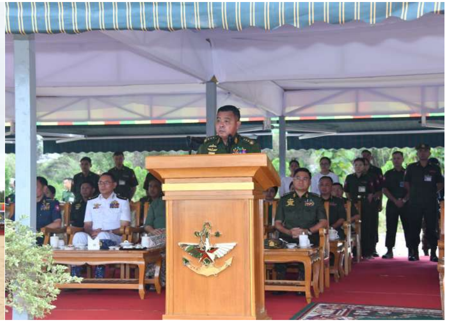
General Ye Win Oo delivers a speech at the second rainy season tree planting ceremony for 2026 by families of the Office of the Commander-in-Chief of Defence Services (Army, Navy and Air).

Nay Pyi Taw July 2 The second rainy season tree planting ceremony by families of the Office of the Commander-in-Chief of Defence Services (Army, Navy and Air) for 2026 was held near Yezin Dam, Zeyathiri Township, Nay Pyi Taw. Commander-in-Chief of Defence Services General Ye Win Oo attended and led the ceremony by planting of a valuable teak tree.