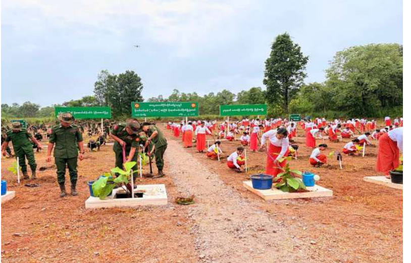
အရှေ့အလယ်ပိုင်းတိုင်းစစ်ဌာနချုပ်၌ ၂၀၂၆ ခုနှစ် ဒုတိယအကြိမ် မိုးရာသီသစ်ပင် စိုက်ပျိုးပွဲ ကျင်းပစဉ်။