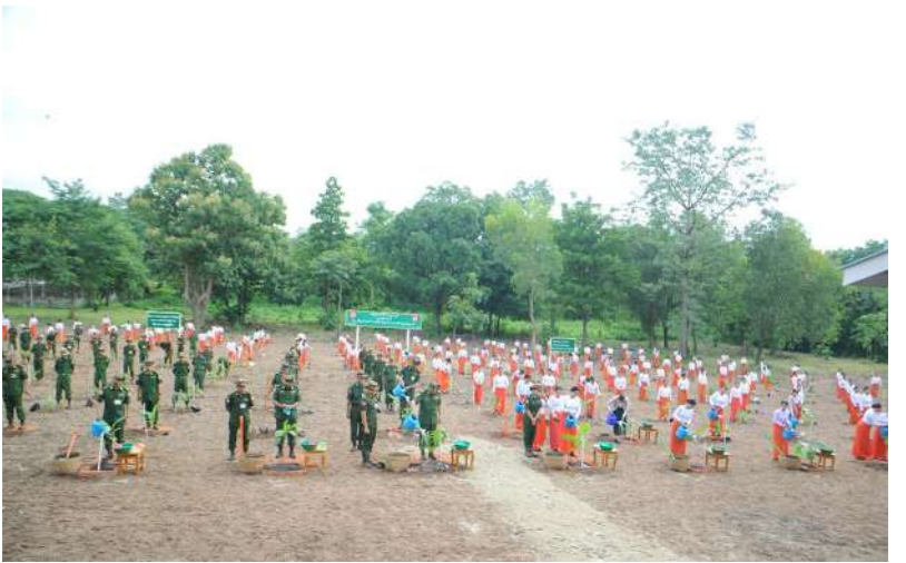
နေပြည်တော်တိုင်းစစ်ဌာနချုပ်၌ ၂၀၂၆ ခုနှစ် ဒုတိယအကြိမ် မိုးရာသီသစ်ပင်စိုက်ပျိုးပွဲ ကျင်းပစဉ်။

ဦးစီးချုပ်နှင့်ဇနီးတို့က ရတနာတန်းဝင်း ကျွန်းပင်ကို ဦးဆောင်စိုက်ပျိုးပေးကြသည်။ ယင်းနောက် အခမ်းအနားတက်ရောက်လာ ကြသူများက သတ်မှတ်နေရာအသီးသီးတွင် သစ်ပင်များကို စိုက်ပျိုးကြသည်။ ထို့နောက် တပ်မတော်ကာကွယ်ရေး ဦးစီးချုပ်နှင့်ဇနီး၊ အဖွဲ့ဝင်များသည် အရာရှိ၊ စစ်သည်၊ မိသားစုများ၏ စုပေါင်းသစ်ပင်စိုက် ပျိုးနေမှုကို လှည့်လည်ကြည့်ရှုအားပေး ကြသည်။ အလားတူ တိုင်းစစ်ဌာနချုပ်နယ်မြေ အသီးသီး၌လည်း ဒုတိယအကြိမ် မိုးရာသီ သစ်ပင်စိုက်ပွဲများကျင်းပ၍ ရတနာတန်း ဝင်းပင်၊ စာမျက်နှာ ၁၈ သို့