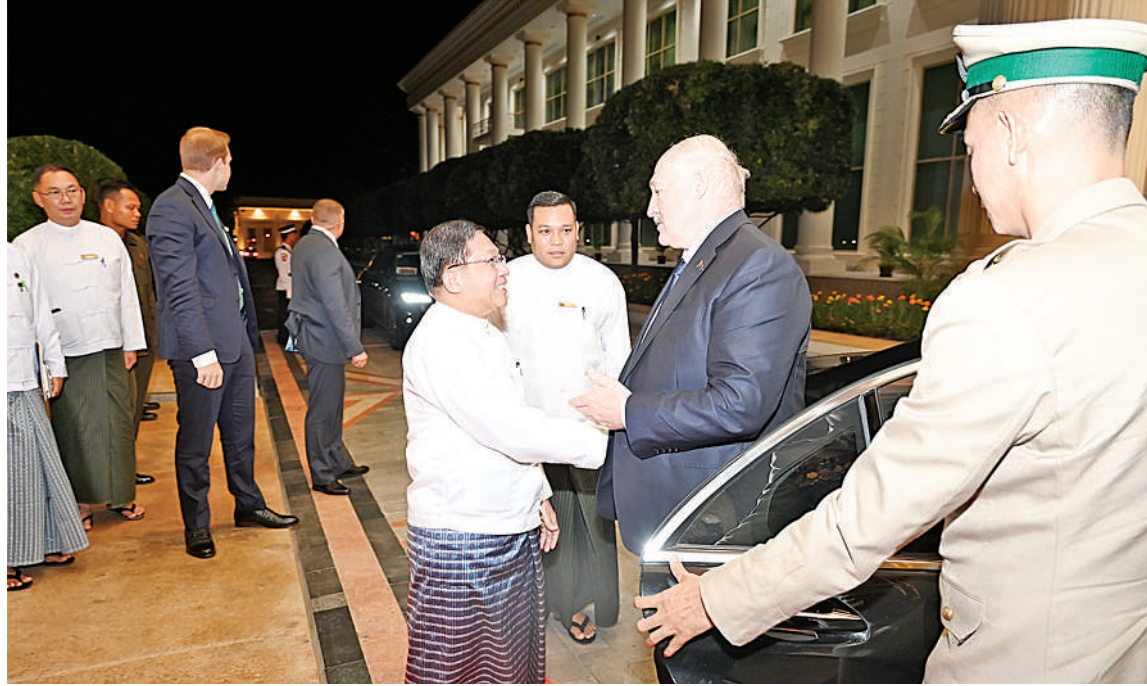
ပြည်ထောင်စုသမ္မတမြန်မာနိုင်ငံတော် နိုင်ငံတော်သမ္မတ ဦးမင်းအောင်လှိုင် ဘယ်လာရုစ်သမ္မတနိုင်ငံ သမ္မတ မစ္စတာ အလက်ဇန္ဒား လူကာရုန်ကိုအား ရင်းနှီးနှေးထွေးစွာ ကြိုဆိုနှုတ်ဆက်စဉ်။

ဘယ်လာရုစ်သမ္မတနိုင်ငံ သမ္မတ မစ္စတာ အလက်ဇန္ဒား လူကာရုန်ကို