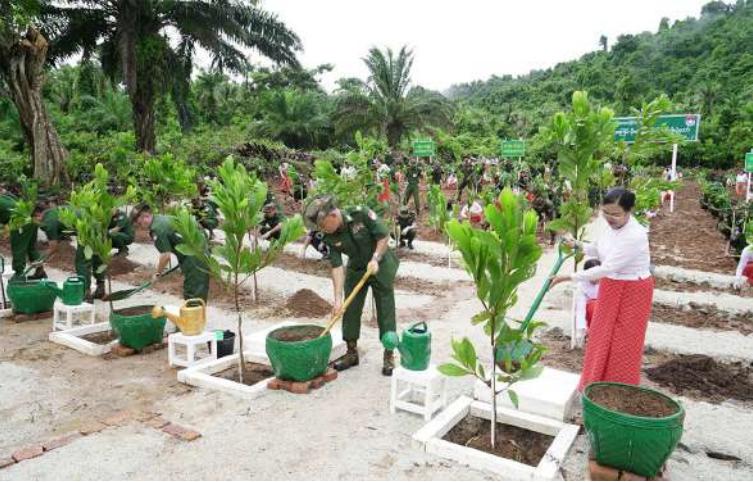
ကမ်းရိုးတန်းဒေသ တိုင်းစစ်ဌာနချုပ် ၂၀၂၆ ခုနှစ် ဒုတိယအကြိမ် မိုးရာသီ သစ်ပင် စိုက်ပျိုးပွဲ ကျင်းပစဉ်။