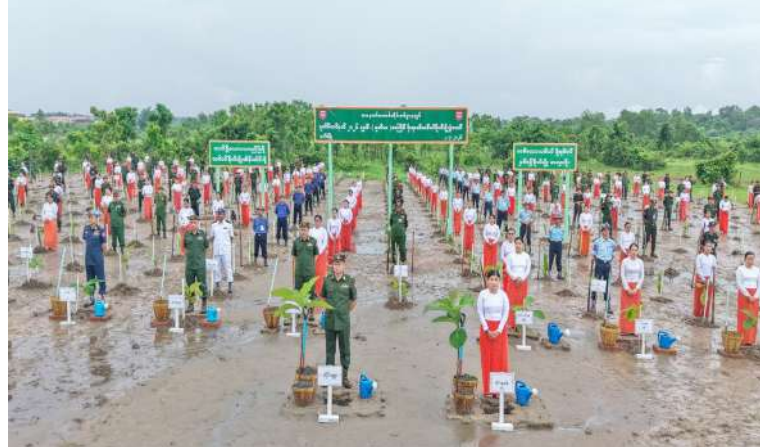
အနောက်တောင် တိုင်းစစ်ဌာနချုပ် ၂၀၂၆ ခုနှစ် ဒုတိယအကြိမ် မိုးရာသီ သစ်ပင် စိုက်ပျိုးပွဲ ကျင်းပစဉ်။