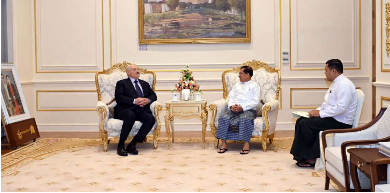
President of the Republic of the Union of Myanmar U Min Aung Hlaing holds talks with President of the Republic of Belarus Mr. Aleksandr Lukashenko.

Nay Pyi Taw July 2 President of the Republic of the Union of Myanmar U Min Aung Hlaing held a talk with President of the Republic of Belarus Mr. Aleksandr Lukashenko on his working visit to Myanmar and his delegation members at the Presidential Palace Reception Hall this afternoon.