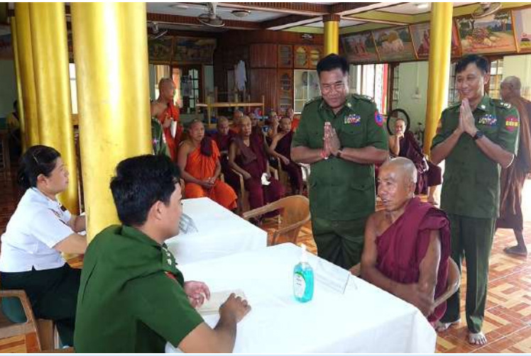
သံဃာတော်များအား မြောက်ပိုင်းတိုင်းစစ်ဌာနချုပ် နယ်လှည့်ဆေးကုသရေးအဖွဲ့က ကျန်းမာရေးစောင့်ရှောက်မှုလုပ်ငန်းများ ဆောင်ရွက်ပေးနေမှုကို မြစ်ကြီးနားတပ်နယ်မှ တာဝန်ရှိသူများက သွားရောက်ကြည့်ရှုအားပေးစဉ်။

ခြင်း၊ ဓာတ်မှန်ရိုက်၍ ရောဂါရှာဖွေပေးခြင်း များ ဆောင်ရွက်ပေးပြီး ဆေးရုံတက်ရောက် ကုသရန် လိုအပ်သော သံဃာတော်များကို နယ်မြေခံတပ်မတော်ဆေးရုံသို့ တက်ရောက် ကုသနိုင်ရေး စီစဉ်ဆောင်ရွက်ပေးသည်။ ယင်းသို့ ဆောင်ရွက်ပေးနေမှုများကို မြစ်ကြီးနားတပ်နယ်မှ တာဝန်ရှိသူများက သွားရောက်ကြည့်ရှုအားပေးပြီး အဆိုပါ ကျောင်းတိုက်ရှိ သံဃာတော်များအား လှူဖွယ်ပစ္စည်းများနှင့် နေ့ဆွမ်းများ ဆက်ကပ်လှူဒါန်းခဲ့ကြကြောင်း သတင်း ရရှိသည်။ (၅၀၁)