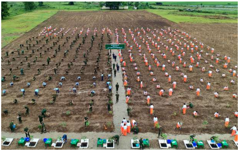
မြောက်ပိုင်းတိုင်းစစ်ဌာနချုပ်၌ ၂၀၂၆ ခုနှစ် ဒုတိယအကြိမ် မိုးရာသီသစ်ပင်စိုက်ပျိုးပွဲ ကျင်းပစဉ်။