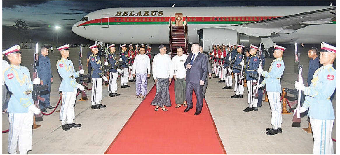
ဘယ်လာရုစ်သမ္မတနိုင်ငံ သမ္မတ H.E. Mr. Alexander Gregoryevich Lukashenko ဦးဆောင်သည့် အဆင့်မြင့် ကိုယ်စားလှယ်အဖွဲ့ကို ပို့ဆောင်ရေးဝန်ကြီးဌာန၊ ဒစ်ဂျစ်တယ်ဖွံ့ဖြိုးတိုးတက်ရေးနှင့် ဆက်သွယ်ရေးဝန်ကြီးဌာန ပြည်ထောင်စု ဝန်ကြီး ဦးမြထွန်းဦးနှင့် တာဝန်ရှိသူများက လေဆိပ်၌ ရင်းနှီးနှေးထွေးစွာ ကြိုဆိုနှုတ်ဆက်စဉ်။

ရေးဝန်ကြီးဌာန ပြည်ထောင်စုဝန်ကြီး ဦးမြထွန်းဦး၊ နိုင်ငံခြားရေးဝန်ကြီးဌာန ဒုတိယဝန်ကြီး ဦးကိုကိုကျော်၊ ဘယ်လာရုစ် သမ္မတနိုင်ငံဆိုင်ရာ မြန်မာနိုင်ငံသံအမတ် ကြီး၊ မြန်မာနိုင်ငံဆိုင်ရာ ဘယ်လာရုစ် သမ္မတနိုင်ငံ သံအမတ်ကြီးနှင့် တာဝန်ရှိ သူများက လေဆိပ်၌ ရင်းနှီးနှေးထွေးစွာ ကြိုဆိုနှုတ်ဆက်ကြသည်။ ထို့ပြင် ဘယ်လာရုစ်သမ္မတနိုင်ငံ သမ္မတ ဦးဆောင်သည့် အဆင့်မြင့် ကိုယ်စားလှယ်အဖွဲ့ကို ဂုဏ်ပြုတပ်ဖွဲ့က အလေးပြု၍လည်းကောင်း၊ မြန်မာ ကလေးငယ်နှစ်ဦးက ပန်းစည်းကမ်း၍ လည်းကောင်း ဂုဏ်ပြုကြိုဆိုကြကြောင်း သတင်းရရှိသည်။ (သတင်းစဉ်)