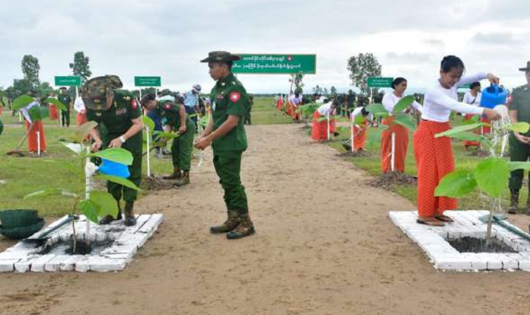
တောင်ပိုင်း တိုင်းစစ်ဌာနချုပ် ၂၀၂၆ ခုနှစ် ဒုတိယအကြိမ် မိုးရာသီ သစ်ပင် စိုက်ပျိုးပွဲ ကျင်းပစဉ်။