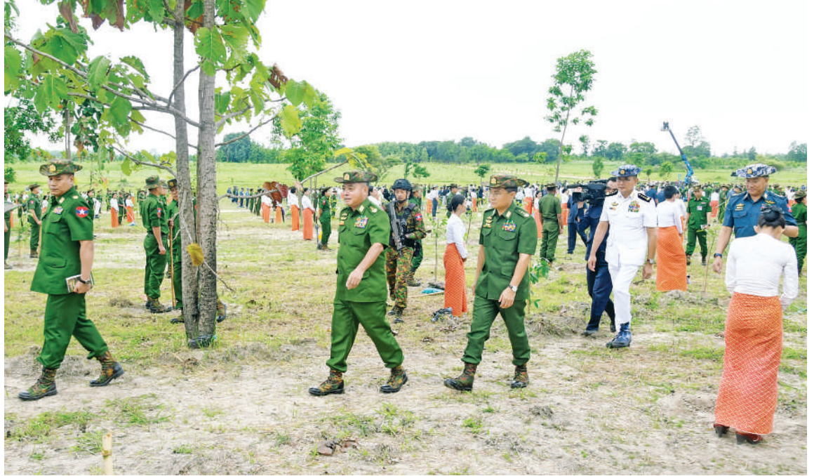
တပ်မတော်ကာကွယ်ရေးဦးစီးချုပ် ဗိုလ်ချုပ်ကြီးရဲဝင်းဦး အရာရှိ၊ စစ်သည်၊ မိသားစုများ၏ စုပေါင်းသစ်ပင်စိုက်ပျိုးနေမှုကို လှည့်လည်ကြည့်ရှုအားပေးစဉ်။

နှင့် ဇနီး၊ ကာကွယ်ရေးဦးစီးချုပ်(ရေ) ဗိုလ်ချုပ်ကြီးထိန်ဝင်းနှင့် ဇနီး၊ ကာကွယ် ရေးဦးစီးချုပ်(လေ) ဒုတိယဗိုလ်ချုပ်ကြီး ထွန်းဝင်းနှင့် ဇနီး၊ ကာကွယ်ရေးဦးစီးချုပ် ရုံးမှ တပ်မတော်အရာရှိကြီးများနှင့် ဇနီး များ၊ နိုင်ငံတော်ကာကွယ်ရေးတက္ကသိုလ်မှ သင်တန်းသားအရာရှိကြီးများ၊ ကာကွယ် ရေးဦးစီးချုပ်ရုံး(ကြည်း၊ ရေ၊ လေ) ရုံးဌာန အသီးသီးမှ အရာရှိ၊ စစ်သည်များနှင့် မိသားစုဝင်များ တက်ရောက်ကြသည်။ ဦးစွာ တပ်မတော်ကာကွယ်ရေးဦးစီး ချုပ် ဗိုလ်ချုပ်ကြီးရဲဝင်းဦးက အမှာစကား ပြောကြားရာတွင် ယနေ့ မိမိတို့နေထိုင် သည့်ကမ္ဘာမြေတစ်ဝန်းတွင် နေ့စဉ်နှင့်အမျှ ရင်ဆိုင်ကြုံတွေ့နေကြရသည့် ပြဿနာ သည် ရာသီဥတု ပြောင်းလဲဖောက်ပြန်ခြင်း၊ ပတ်ဝန်းကျင်ယိုယွင်းပျက်စီးခြင်း၊ စာမျက်နှာ ၁၆ ကော်လံ ၁ ☆