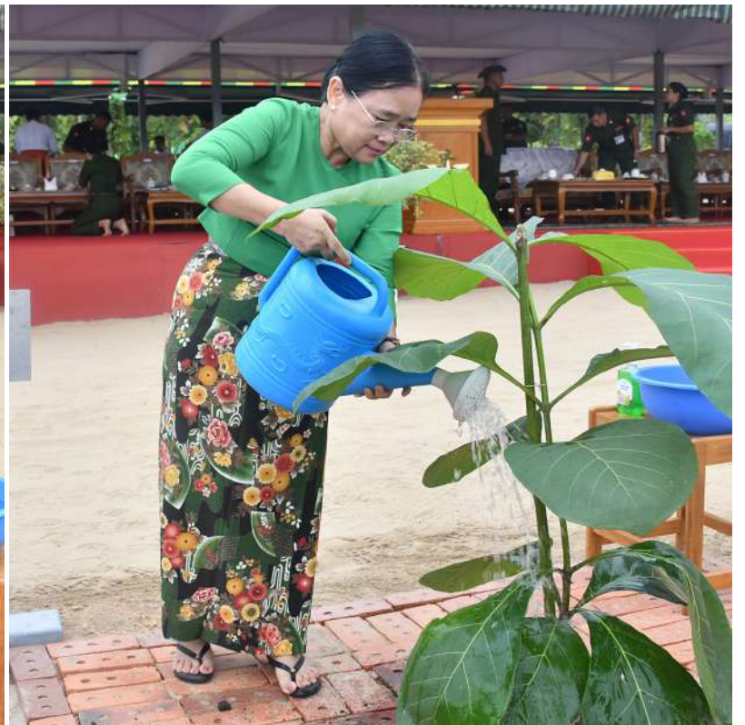
ဒုတိယတပ်မတော်ကာကွယ်ရေးဦးစီးချုပ် ကာကွယ်ရေးဦးစီးချုပ်(ကြည်း) ဗိုလ်ချုပ်ကြီးကျော်စွာလင်းနှင့် ဇနီး ဒေါ်နန်းကူးကူ ရတနာတန်းဝင်ကျွန်းပင်ကို စိုက်ပျိုးပေးစဉ်။

“သစ်တောတွေထိန်း၊ တောတွေစိမ်းမှ၊ ငြိမ်းချမ်းပြည်ရွာ၊ နိုင်ငံသာ၏”ဆိုသည့် ဆောင်ပုဒ်နှင့်အညီ တစ်နိုင်ငံလုံး စိမ်းလန်းစိုပြည်သာယာလှပစေရေး၊ ရာသီဥတုပြန်လည် မျှတကောင်းမွန်စေရေးနှင့် သစ်ပင်သစ်တောများ၊ သစ်တောဂေဟစနစ်များ စဉ်ဆက်မပြတ် တည်တံ့စေရေးတို့အတွက် ပိုင်းဝန်းထိန်းသိမ်း ကာကွယ်သွားကြရမည်ဖြစ် . . .