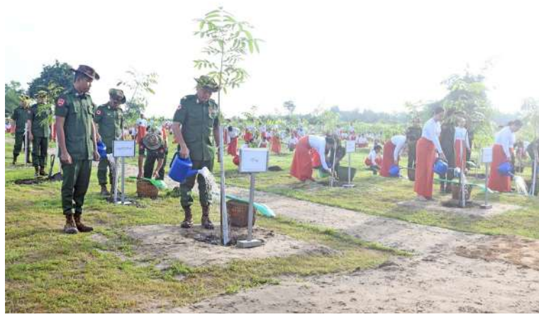
ရန်ကုန်တိုင်း စစ်ဌာနချုပ် ၂၀၂၆ ခုနှစ် ဒုတိယအကြိမ် မိုးရာသီ သစ်ပင် စိုက်ပျိုးပွဲ ကျင်းပစဉ်။