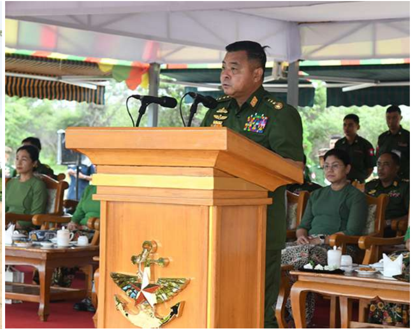
တပ်မတော်ကာကွယ်ရေးဦးစီးချုပ် ဗိုလ်ချုပ်ကြီးရဲဝင်းဦး ကာကွယ်ရေးဦးစီးချုပ်ရုံး(ကြည်း၊ ရေ၊ လေ) မိသားစုများ၏ ၂၀၂၆ ခုနှစ် ဒုတိယအကြိမ် မိုးရာသီသစ်ပင်စိုက်ပျိုးပွဲတွင် အမှာစကားပြောကြားစဉ်။