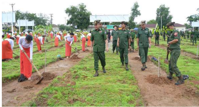
အရှေ့တောင်တိုင်း စစ်ဌာနချုပ် ၂၀၂၆ ခုနှစ် ဒုတိယအကြိမ် မိုးရာသီ သစ်ပင် စိုက်ပျိုးပွဲ ကျင်းပစဉ်။

များ၊ အရာရှိ၊ စစ်သည်၊ မိသားစုများက စုပေါင်းစိုက်ပျိုးခဲ့ကြပြီး တပ်မတော်တစ်ရပ် လုံးအနေဖြင့် ယနေ့တွင် စုစုပေါင်းသစ်ပင် ၁၇၈၈၇၇ ပင်ကို စိုက်ပျိုးခဲ့ကြကြောင်း သတင်းရရှိသည်။ (၅၀၁)