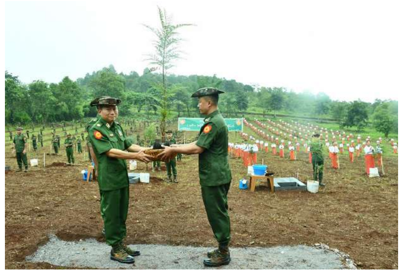
အရှေ့မြောက်တိုင်းစစ်ဌာနချုပ်၌ ၂၀၂၆ ခုနှစ် ဒုတိယအကြိမ် မိုးရာသီသစ်ပင်စိုက်ပျိုးပွဲ ကျင်းပစဉ်။