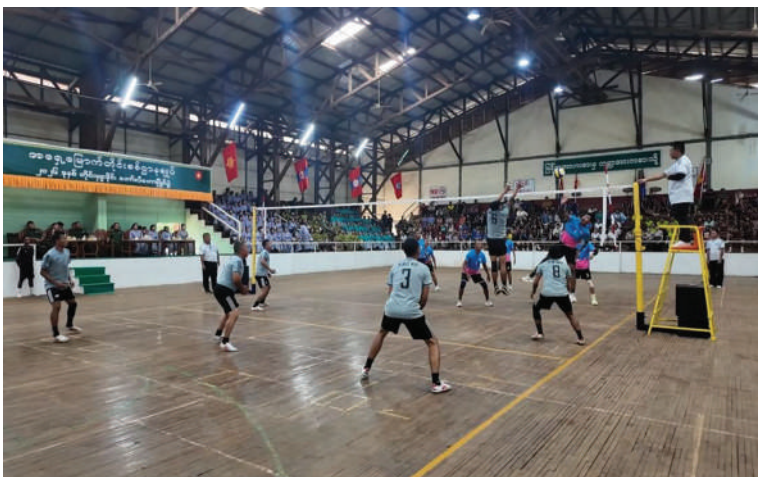
အရှေ့မြောက်တိုင်းစစ်ဌာနချုပ် တိုင်းမှူးဒိုင်း ဘော်လီဘောပြိုင်ပွဲ ဗိုလ်လုပွဲ ယှဉ်ပြိုင်ကစားနေမှုကို တွေ့ရစဉ်။

ဂုဏ်ပြုဆုများ အသီးသီးပေးအပ် ကြသည်။ အဆိုပါ တိုင်းမှူးဒိုင်း ဘော်လီဘော ပြိုင်ပွဲကို တိုင်းစစ်ဌာနချုပ်ကွပ်ကဲမှု အောက် တပ်နယ်များမှ ပြိုင်ပွဲဝင် အမျိုးသားအသင်း ၁၀ သင်းနှင့် အမျိုးသမီး အသင်း ၁၀ သင်းတို့ဖြင့် ဇွန် ၂၆ ရက်မှ ယနေ့ထိ ယှဉ်ပြိုင်ကစားခဲ့ခြင်းဖြစ် ကြောင်း သတင်းရရှိသည်။ (၅၀၁)