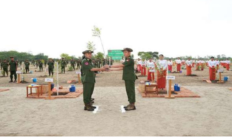
အနောက်မြောက် တိုင်းစစ်ဌာနချုပ် ၂၀၂၆ ခုနှစ် ဒုတိယအကြိမ် မိုးရာသီ သစ်ပင် စိုက်ပျိုးပွဲ ကျင်းပစဉ်။