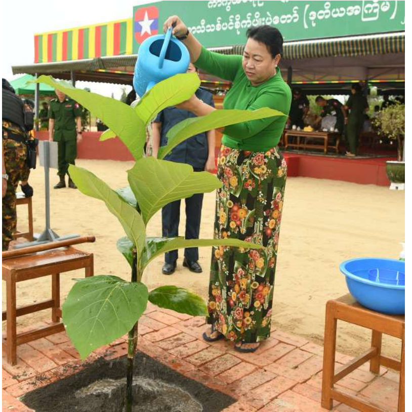
တပ်မတော်ကာကွယ်ရေးဦးစီးချုပ် ဗိုလ်ချုပ်ကြီးရဲဝင်းဦးနှင့်ဇနီး ဒေါ်နီလာ ရတနာတန်းဝင်းကျွန်းပင်ကို ဦးဆောင်စိုက်ပျိုးပေးစဉ်။