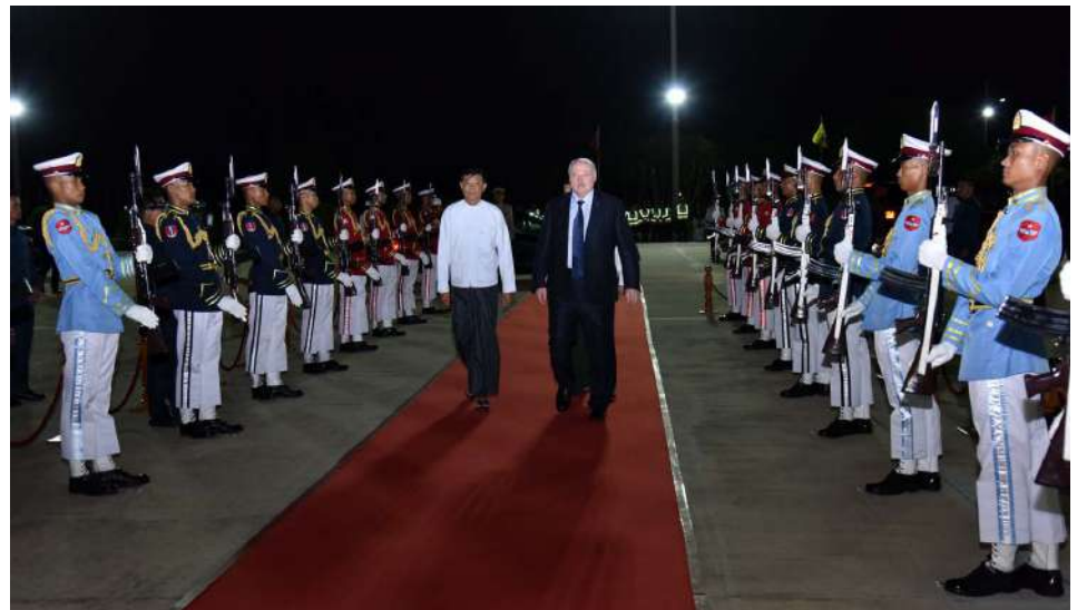
President of the Republic of Belarus Mr. Aleksandr Lukashenko being seen off at the airport.

Subsequently, the high-level delegation led by the President of the Republic of Belarus departed from Nay Pyi Taw Airport. Union Minister for Transport and for Digital Development and Communications U Mya Tun Oo, Deputy Minister for Foreign Affairs U Ko Ko Kyaw, the Ambassador of Myanmar to Belarus, the Ambassador of Belarus to Myanmar, and responsible officials saw them off at the airport. MNA