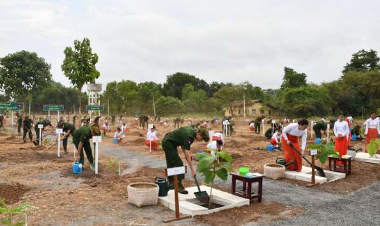
အလယ်ပိုင်း တိုင်းစစ်ဌာနချုပ် ၂၀၂၆ ခုနှစ် ဒုတိယအကြိမ် မိုးရာသီ သစ်ပင် စိုက်ပျိုးပွဲ ကျင်းပစဉ်။