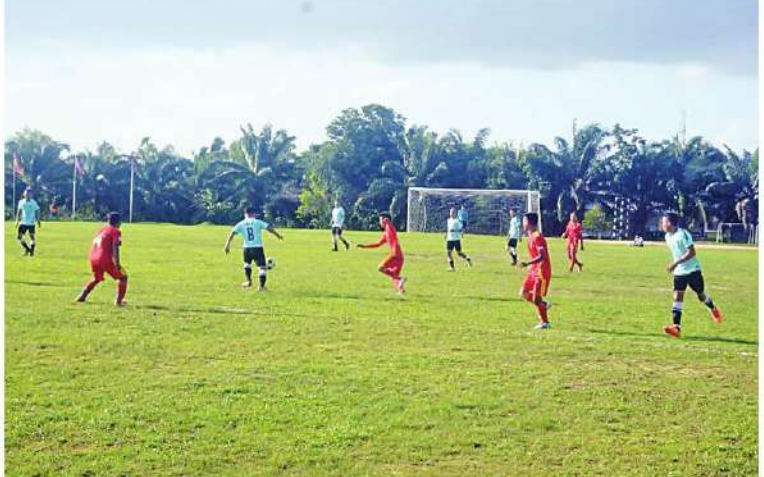
ကမ်းရိုးတန်းဒေသတိုင်းစစ်ဌာနချုပ် ၂၀၂၄ ခုနှစ် တိုင်းမှူးခိုင်းဘောလုံးပြိုင်ပွဲ အဖွင့် ပွဲစဉ်ဖြစ် ကမ်းရိုးတန်းဒေသတိုင်းစစ်ဌာနချုပ် (စခန်းရုံး)အသင်းနှင့် မြိတ်လေတပ်စခန်း ဌာနချုပ်အသင်းတို့ ယှဉ်ပြိုင်ကစားကြစဉ်။

နေပြည်တော် ဇွန် ၁၃ ကမ်းရိုးတန်းဒေသတိုင်းစစ်ဌာနချုပ် ၂၀၂၄ ခုနှစ် တိုင်းမှူးခိုင်း ဘောလုံးပြိုင်ပွဲ ဖွင့်ပွဲကို ယနေ့ညနေပိုင်းတွင် တိုင်းစစ် ဌာနချုပ် အားကစားကွင်း၌ ပြုလုပ်ရာ တိုင်းမှူး ဗိုလ်မှူးချုပ်ပြည့်စုံလင်းနှင့် တာဝန်ရှိသူများ၊ ဌာနဆိုင်ရာတာဝန်ရှိသူ များ၊ အရာရှိ၊ စစ်သည်၊ မိသားစုများ၊ ခိုင်အဖွဲ့ဝင်များ၊ ပြိုင်ပွဲဝင်အားကစားသမား များနှင့် အားကစားဝါသနာရှင်များ တက်ရောက်ကြသည်။ ဦးစွာ တိုင်းမှူးက အမှာစကား ပြောကြားသည်။ ထို့နောက် တိုင်းမှူးနှင့် တက်ရောက်လာသူများက အဖွင့်ပွဲစဉ် ဖြစ်သည့် ကမ်းရိုးတန်းဒေသတိုင်း စစ်ဌာနချုပ် (စခန်းရုံး)အသင်းနှင့် မြိတ် လေတပ်စခန်းဌာနချုပ်အသင်းတို့ ယှဉ်ပြိုင် ကစားနေမှုများကို ကြည့်ရှုအားပေးကြသည်။ အဆိုပါ တိုင်းမှူးခိုင်းဘောလုံးပြိုင်ပွဲ ကို တိုင်းစစ်ဌာနချုပ်ကွပ်ကဲမှုအောက် တပ်နယ် တပ်ရင်း၊ တပ်ဖွဲ့များမှ ပြိုင်ပွဲဝင် အသင်း ရှစ်သင်းဖြင့် ဇွန် ၂၄ ရက်ထိ ယှဉ်ပြိုင်ကစားသွားမည်ဖြစ်ကြောင်း သတင်း ရရှိသည်။ (၅၀၀)