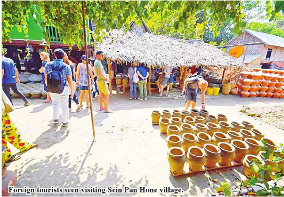
Foreign tourists seen visiting Sein Pan Hone village.