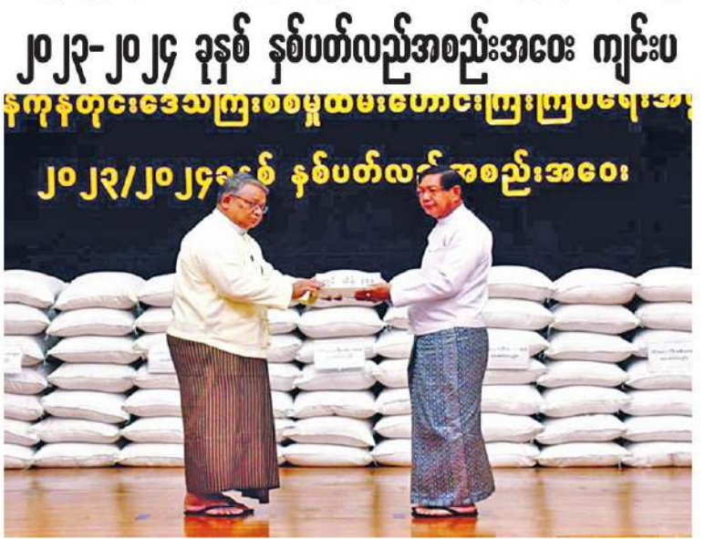
ရန်ကုန်တိုင်းဒေသကြီးဝန်ကြီးချုပ် ဦးစိုးသိန်း၊ စစ်မှုထမ်းဟောင်းကြီးကြပ်ရေးအဖွဲ့ ကို ချီးမြှင့်ငွေများ ပေးအပ်စဉ်။

နေပြည်တော် ဇွန် ၁၃ မြန်မာနိုင်ငံ စစ်မှုထမ်းဟောင်းအဖွဲ့၊ ရန်ကုန်တိုင်းဒေသကြီး စစ်မှုထမ်းဟောင်း ကြီးကြပ်ရေးအဖွဲ့ ၂၀၂၃-၂၀၂၄ ခုနှစ် နှစ်ပတ်လည်အစည်းအဝေးကို ယနေ့ နံနက်ပိုင်းတွင် ရန်ကုန်တိုင်းစစ်ဌာနချုပ်ရှိ အနော်ရထာခန်းမ၌ ပြုလုပ်ရာ ရန်ကုန်တိုင်း ဒေသကြီးဝန်ကြီးချုပ် ဦးစိုးသိန်း၊ ရန်ကုန်တိုင်း စစ်ဌာနချုပ်တိုင်းမှူး၊ ဗိုလ်ချုပ်ဇော်ဟိန်းနှင့် တာဝန်ရှိသူများ၊ မြန်မာနိုင်ငံစစ်မှုထမ်းဟောင်း အဖွဲ့ ဝန်ကြီးချုပ်မှ တာဝန်ရှိသူများနှင့် ရန်ကုန်တိုင်းဒေသကြီး စစ်မှုထမ်းဟောင်း ကြီးကြပ်ရေးအဖွဲ့များ တက်ရောက်ကြသည်။ ဦးစွာ ရန်ကုန်တိုင်းဒေသကြီး စစ်မှုထမ်း ဟောင်းကြီးကြပ်ရေးအဖွဲ့ နာယက