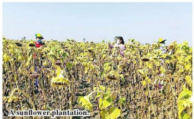
A sunflower plantation.

“Sunflowers are mainly planted in winter. In order to reduce the import of palm oil from abroad, we have been able to expand the cultivation of sunflower, which is an oilseed crop,” said Daw 206