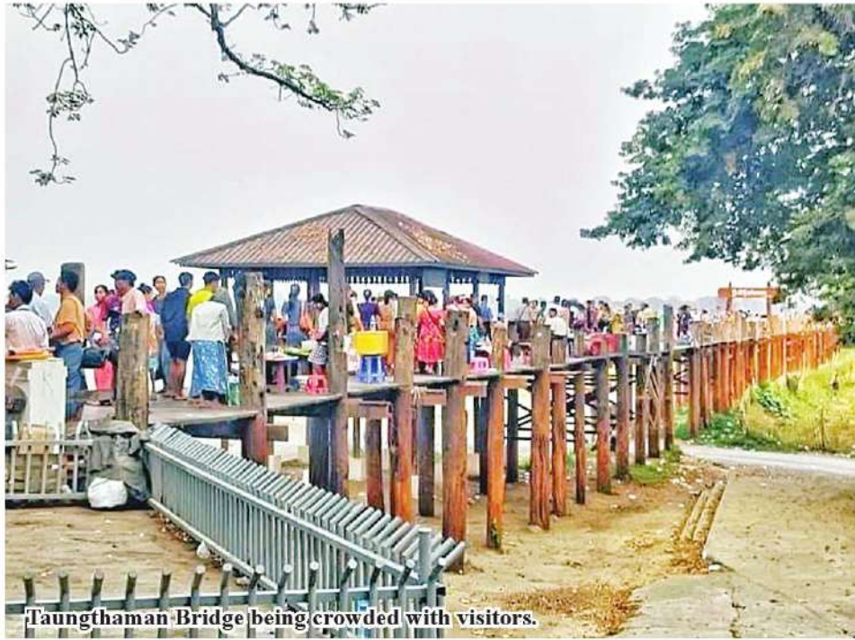
Taungthaman Bridge being crowded with visitors.