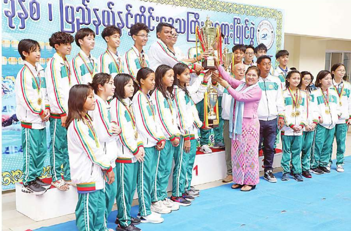
နေပြည်တော် ဇွန် ၁၃ ၂၀၂၄ ခုနှစ် ပြည်နယ်နှင့်တိုင်းဒေသကြီး ရေကူးပြိုင်ပွဲပိုလ်လှပွဲနှင့် ဆုချီးမြှင့်ပွဲအခမ်းအနားကို ယနေ့မနက်လွှဲပိုင်းတွင် နေပြည်တော်ရှိ ဝဏ္ဏသိဒ္ဓိရေကူးကန်၌ အုပ်ချုပ်ရေးကောင်စီအဖွဲ့ဝင်များဖြစ်ကြ ကျင်းပရာ နိုင်ငံတော်စီမံအုပ်ချုပ်ရေးကောင်စီအဖွဲ့ဝင်များ တက်ရောက်ကြည့်ရှုအားပေးကြသည်။ အခမ်းအနားသို့ နိုင်ငံတော်စီမံအုပ်ချုပ်ရေးကောင်စီအဖွဲ့ဝင်များဖြစ်ကြ များ၊ စာမျက်နှာ ၁၈ ကော်လံ ၁ ☆