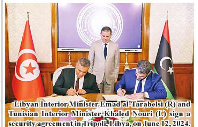
Libyan Interior Minister Emad al-Tarabelsi (R) and Tunisian Interior Minister Khaled Nouri (L) sign a security agreement in Tripoli, Libya, on June 12, 2024.

For his part, Tunisian Interior Minister Khaled Nouri expressed Tunisia's commitment to enhancing cooperation with Libya and addressing challenges impacting the flow of passengers through the border crossings. Xinhua