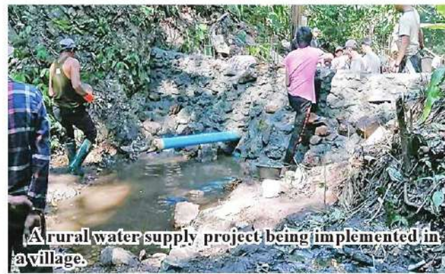
A rural water supply project being implemented in a village.

In 2023-24 FY, a total of 1,302 projects of water supply were earmarked and all projects have been accomplished at cent per cent. In this regard, the original allocated fund was spent on 255 projects and the fund in cooperation with UNICEF on 371 projects, totalling