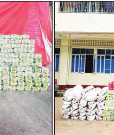
၂၀၂၃ ခုနှစ် ဒီဇင်ဘာလအတွင်း AA တပ်ဖွဲ့ဝင်များနှင့်အတူ ဖမ်းဆီးရမိသည့် မူးယစ်ဆေးဝါးများ

ဖြစ်ပြီး ဖမ်းဆီးရမိမှုများ၏နောက်ကွယ် တွင် AA တပ်ဖွဲ့ဝင်များကိုယ်တိုင် ပါဝင် ပတ်သက်မှုရှိကြောင်း DNC အဖွဲ့ရဲ့ ၂၀၂၁ ခုနှစ် အစီရင်ခံစာမှာ ဖော်ပြထား ရှိပါတယ်။ AA အဖွဲ့ စတင်ပေါ်ပေါက်လာပြီး နောက်ပိုင်း ရခိုင်ပြည်နယ်အတွင်း Yaba စိတ်ကြွဆေးပြားများ သိသိသာသာပေါ များလာပြီး ရခိုင်လူငယ်များသာမက ဘင်္ဂလားဒေ့ရှ်နယ်စပ်ရှိ ဘင်္ဂါလီဒုက္ခသည် စခန်းများမှာလည်း စိတ်ကြွဆေးပြား