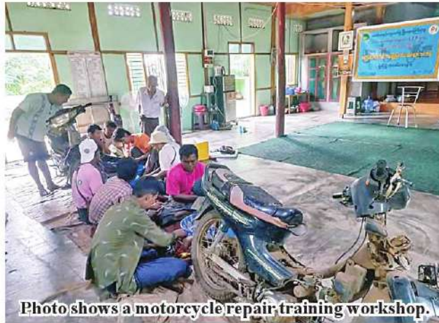
Photo shows a motorcycle repair training workshop.

“There are courses provided directly by the department as well as those conducted in collaboration with partner organizations. So far, we have conducted 10 livelihood support training sessions. The duration of each course varies depending on the type of training. Graduates of these courses have been able to start their own businesses in their local areas. We provide training for both urban and rural residents, with a focus on going to rural areas to teach technical skills. These courses allow families to stay together and start their own businesses, leading to more job opportunities and increased income through the production and sale of