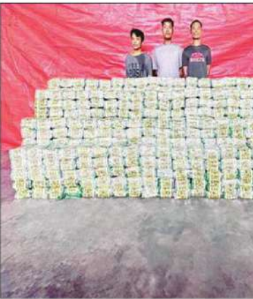
၂၀၂၃ ခုနှစ် ဒီဇင်ဘာလအတွင်း AA တပ်ဖွဲ့ဝင်များနှင့်အတူ ဖမ်းဆီးရမိသည့် မူးယစ်ဆေးဝါးများ

ရကြောင်း၊ လက်နက်မှောင်ခိုဝိုင်းများနဲ့ ချိတ်ဆက်ပြီး လက်နက်နဲ့ စိတ်ကြွဆေးပြား အလဲအလှယ်ပြုလုပ်လေ့ရှိကြောင်း၊ မူးယစ်