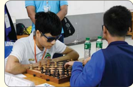
အမျိုးသားမျက်မမြင် စစ်တုရင်ပြိုင်ပွဲ ယှဉ်ပြိုင်နေမှုကို တွေ့ရစဉ်။