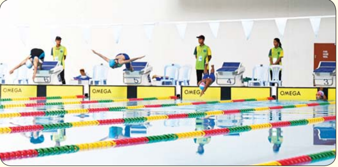
မသန်စွမ်းရေကူးအမျိုးသမီး S 6.10 မီတာ(၅၀)အလွတ်ကူးပြိုင်ပွဲ ယှဉ်ပြိုင်နေမှုကို တွေ့ရစဉ်။