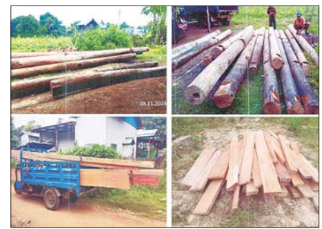
အော်တိုတယ်လီဖုန်းနံပါတ် - ၀၆၇-၄၀၉၈၈၃ နှင့် အီးမေးလ် antiillegalttradeinfo@gmail.com သို့ သတင်းပေးပို့ တိုင်ကြားနိုင်ကြောင်း သိရသည်။ သတင်းစဉ်

ဖြစ်သည်။ သတင်းရရှိမှုကြောင့် ဖမ်းဆီးရမိ အမှုတွဲ ၇၇ မှု ဖြင့်လွှတ် ထားပြီး ဖမ်းဆီးရမိမှုများတွင် သစ်မျိုးစုံ၊ လုပ်ငန်းသုံးပစ္စည်းများ၊ လူသုံးကုန်ပစ္စည်းများနှင့် စားသောက်ကုန်ပစ္စည်းများဖြစ်သော ကုန် ပစ္စည်း ၅၅ မျိုး အပါအဝင် ခန့်မှန်းတန်ဖိုးငွေကျပ် ၁၆၅၈ ၃၁၀ ၅၀၀ သန်းနှင့် တရားမဝင်ကုန်စည်များ တင်ဆောင်လာသည့် မော်တော် ယာဉ်များအပါအဝင် လိုင်စင်မဲ့ယာဉ်နှင့် လိုင်စင်မဲ့မော်တော်ယာဉ် ၂၀၂၄ ခုနှစ် နိုဝင်ဘာလအတွင်း သတင်းပေးတိုင်ကြားခဲ့သည့် တာဝန်ခံသိပြည်သူများကိုလည်း ဖမ်းဆီးရမိမှုတန်ဖိုးငွေကျပ် ၁၆၅၈ ၃၁၀ ၅၀၀ သန်း၏ ၂၀ ရာခိုင်နှုန်းဖြစ်သော ငွေကျပ် ၃၃၅ ၃၁၀ ၅၀၀ သန်းကို သတင်းပေးဆုကြေးငွေအဖြစ် ချီးမြှင့်ပေးသွားမည်ဖြစ်ပြီး သက်ဆိုင်ရာဌာနများမှ မြန်မြန်ဆန်ဆန် ဆုချီးမြှင့်နိုင်ရေး ဆောင်ရွက် ပေးလျက်ရှိသည်။ ထို့ကြောင့် တာဝန်ခံသိပြည်သူများအနေဖြင့် တရားမဝင်ကုန်သွယ်မှု သတင်းများနှင့်ပတ်သက်၍ လက်ကိုင်ဖုန်း - ၀၉၀၄၄၃၃၉၉၉၉