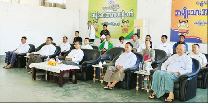
နိုင်ငံတော်စီမံအုပ်ချုပ်ရေးကောင်စီအဖွဲ့ဝင်များဖြစ်ကြသည့် ခွန်စုံလွင်၊ ဦးရွှေကြိမ်း၊ ဦးရန်ကျော်နှင့် တာဝန်ရှိသူများ မသန်စွမ်းအမျိုးသားတိုင်လျက်ဘော်လီဘောပြိုင်ပွဲတွင် ရန်ကုန်တိုင်းဒေသကြီးအသင်းနှင့် ပဲခူးတိုင်းဒေသကြီးအသင်းတို့ ယှဉ်ပြိုင်နေမှုကို ကြည့်ရှုအားပေးစဉ်။