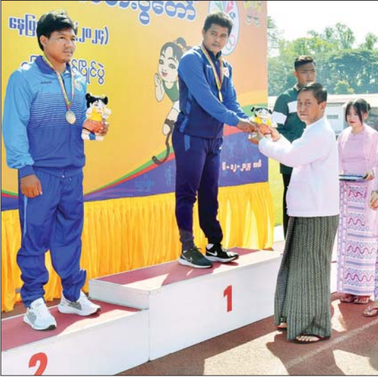
နိုင်ငံတော်စီမံအုပ်ချုပ်ရေးကောင်စီအဖွဲ့ဝင် ခွန်စုံလွင် အမျိုးသား လှံတံပစ် F 62/63 ပြိုင်ပွဲတွင် ပထမဆုရ မန္တလေးတိုင်းဒေသကြီးမှ ပြိုင်ပွဲဝင်အား ဂုဏ်ပြုဆုတံဆိပ် နှင့် အထိမ်းအမှတ်အရုပ်အား ပေးအပ်ချီးမြှင့်စဉ်။

ထို့နောက် ပြည်ထောင်စုဝန်ကြီး Jeng Phang နော်တောင်က အမျိုးသား သံလုံးပစ် F 46 ပြိုင်ပွဲတွင် ပထမဆု ရရှိသည့် ဧရာဝတီတိုင်းဒေသကြီး၊ ဒုတိယ