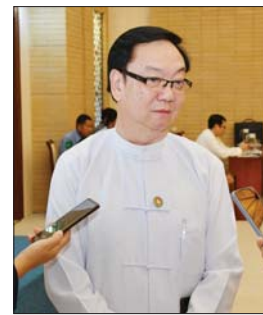
ဒေါက်တာအောင်မြတ်ဦး