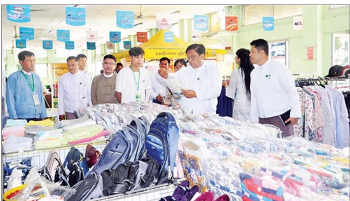
မိမိထုတ်ကုန်များ၏ ကောင်းမွန်သည့် အချက်အလက်များကို နိုင်ငံအနှံ့ လွယ်လင့်တကူ ပျံ့နှံ့ရောက်ရှိသွားမည်ဖြစ်၍ ရရှိသည့်အခွင့်အရေးများကို ပိုင်နိုင်စွာရယူနိုင်ရေး ကြိုးစားဆောင်ရွက်ရမည်

နေပြည်တော် ဒီဇင်ဘာ ၅ အသေးစား၊ အငယ်စားနှင့် အလတ်စား စီးပွားရေး လုပ်ငန်းများ ဖွံ့ဖြိုးတိုးတက်ရေးလုပ်ငန်းကော်မတီ ဒုတိယဥက္ကဋ္ဌ စက်မှုဝန်ကြီးဌာန ပြည်ထောင်စုဝန်ကြီး ဒေါက်တာချာလီသန်းသည် ယနေ့နံနက်ပိုင်းတွင် ပဉ္စမအကြိမ် အမျိုးသားအားကစားပွဲတော် ကျင်းပမည့် ဇမ္ဗူဒီရီမြို့နယ်ရှိ ဝဏ္ဏသိဒ္ဓိအားကစားကွင်း၌ ပြည်ထောင်စုဝန်ကြီး (နေပြည်တော်)အတွင်းရှိ အသေးစား၊ အငယ်စားနှင့် အလတ်စားစီးပွားရေး လုပ်ငန်းများမှ ထုတ်လုပ်သည့် ထုတ်ကုန်ပစ္စည်းများ ခင်းကျင်းပြသရောင်းချရန် ပြင်ဆင်နေမှု၊ ပုဗ္ဗသီရိမြို့နယ်ရှိ တည်းခိုရေးစခန်း(ရွာတော်)တွင် ထုတ်ကုန်ပစ္စည်းများ ခင်းကျင်းပြသရောင်းချနေမှု အခြေအနေကို လှည့်လည်အားပေးကြည့်ရှုစစ်ဆေးရာ တာဝန်ရှိသူများက လိုက်လံရှင်းလင်းပြသသည်။ (အပေါ်ယာပုံ) ယင်းနောက် ပြည်ထောင်စုဝန်ကြီးက ယခုအားကစားပွဲတွင် တိုင်းဒေသကြီး၊ ပြည်နယ်အသီးသီးမှ အားကစားသမားများ ဝင်ရောက်ယှဉ်ပြိုင်မည်ဖြစ်၍