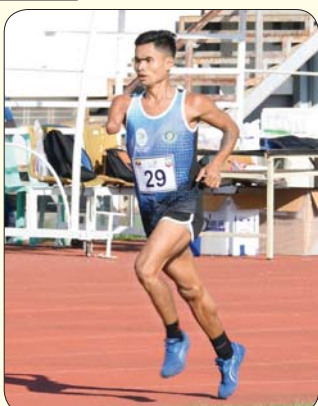
မသန်စွမ်းအမျိုးသား မီတာ(၁၅၀၀) အပြေးပြိုင်ပွဲတွင် ဖြိုင်ပွဲဝင်တစ်ဦး ယှဉ်ပြိုင်နေမှုကို တွေ့ရစဉ်။