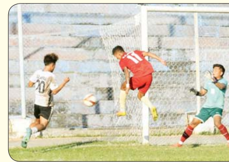
ဝန်ကြီးဌာနပေါင်းစုံ အလွတ်တန်းအမျိုးသား ဘောလုံးပြိုင်ပွဲတွင် နယ်စပ်ရေးရာဝန်ကြီးဌာနအသင်းနှင့် ပြည်ထဲရေးဝန်ကြီးဌာန အသင်းတို့ ယှဉ်ပြိုင်ကစားစဉ်။