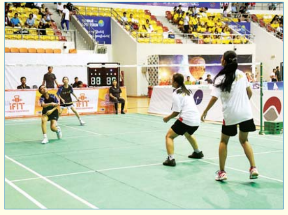
ပြည်နယ်နှင့်တိုင်းဒေသကြီး အမျိုးသမီး ကြက်တောင်ရိုက်ပြိုင်ပွဲတွင် ပြည်ထောင်စု နယ်မြေ နေပြည်တော်အသင်းနှင့် ဧရာဝတီတိုင်းဒေသကြီးအသင်းတို့ ယှဉ်ပြိုင် ကစားစဉ်။