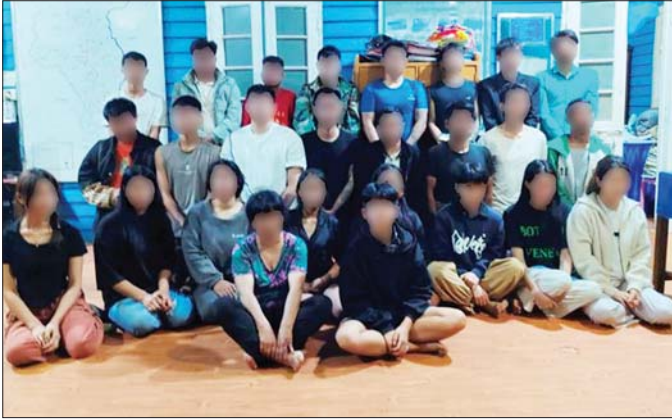
တန့်ယန်းမြို့နယ်၌ အွန်လိုင်းအသုံးပြု၍ ငွေလိမ်လုပ်ငန်းလုပ်ကိုင်နေသည့် မြန်မာနိုင်ငံသား အားဖျင်(ခ) စောက်ရီချိုပါ အမျိုးသား ၁၇ ဦးနှင့် အမျိုးသမီး ၁၀ ဦး၏ မှတ်တမ်းဓာတ်ပုံ။