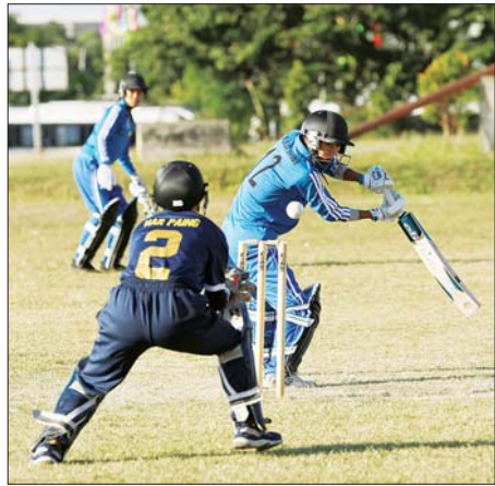
ပြည်နယ်နှင့် တိုင်းဒေသကြီး အသက်(၂၅)နှစ်အောက် အမျိုးသမီး ခရစ်ကတ်ပြိုင်ပွဲတွင် ရှမ်းပြည်နယ်အသင်းနှင့် ရခိုင်ပြည်နယ်အသင်းတို့ ယှဉ်ပြိုင်ကစားစဉ်။

အသာဖြင့်လည်းကောင်း အနိုင်ရရှိခဲ့ကြသည်။ အမျိုးသမီး ခရစ်ကတ်ပြိုင်ပွဲတွင် ကရင်ပြည်နယ်အသင်းက မန္တလေးတိုင်းဒေသကြီးအသင်းကို ရမှတ် ၁၀၉ မှတ်အသာဖြင့်လည်းကောင်း၊ ဧရာဝတီတိုင်းဒေသကြီးအသင်းက ပဲခူးတိုင်းဒေသကြီးအသင်းကို ၃ ပွဲ-၁ ပွဲဖြင့်လည်းကောင်း၊ ရန်ကုန်တိုင်းဒေသကြီး အသင်းက ပြည်ထောင်စုနယ်မြေ နေပြည်တော်အသင်းကို ရှစ်ယောက်အသာဖြင့်လည်းကောင်း၊ ရခိုင်ပြည်နယ်အသင်းက ရှမ်းပြည်နယ်အသင်းကို လေးယောက်အသာဖြင့်လည်းကောင်း အနိုင်ရရှိခဲ့ကြသည်။