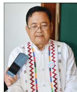
ဦးခေါတ်နဲ့