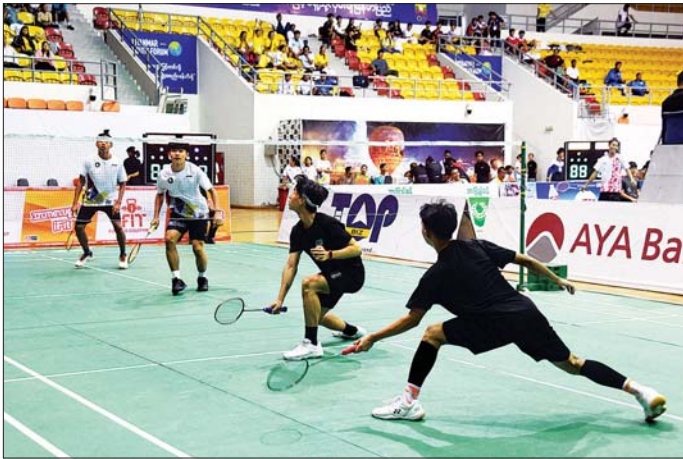
ပြည်နယ်နှင့် တိုင်းဒေသကြီး အမျိုးသားကြက်တောင်ပြိုင်ပွဲတွင် ပြည်ထောင်စုနယ်မြေ နေပြည်တော်အသင်းနှင့် ချင်းပြည်နယ်အသင်းတို့ ယှဉ်ပြိုင်ကစားစဉ်။

ကြက်တောင်ပြိုင်ပွဲများကျင်းပ ပြည်နယ်နှင့် တိုင်းဒေသကြီး ကြက်တောင်ပြိုင်ပွဲကို ဝဏ္ဏသိဒ္ဓိ အားကစားကွင်း (C) ရှိ၍ ကျင်းပရာ အမျိုးသား ကြက်တောင်ပြိုင်ပွဲတွင် ပဲခူးတိုင်းဒေသကြီးအသင်းက ဧရာဝတီတိုင်းဒေသကြီးအသင်းကို ၃ ပွဲ-၁ ပွဲ၊ ရှမ်းပြည်နယ်အသင်းက မွန်ပြည်နယ်အသင်းကို ၃ ပွဲပြတ်၊ ကချင်ပြည်နယ်အသင်းက တနင်္သာရီတိုင်းဒေသကြီးအသင်းကို ၃ ပွဲ-၂ ပွဲ၊ စစ်ကိုင်းတိုင်းဒေသကြီးအသင်းက ကရင်ပြည်နယ်အသင်းကို ၃ ပွဲပြတ်၊ ကယားပြည်နယ်အသင်းက မကွေးတိုင်းဒေသကြီးအသင်းကို ၃ ပွဲ-၁ ပွဲ၊ ချင်းပြည်နယ်အသင်းက ပြည်ထောင်စုနယ်မြေ နေပြည်တော်အသင်းကို ၃ ပွဲပြတ်ဖြင့် လည်းကောင်း၊ ရန်ကုန်တိုင်းဒေသကြီးအသင်းက တနင်္သာရီတိုင်းဒေသကြီးအသင်းကို ၃ ပွဲပြတ်၊ ဧရာဝတီတိုင်းဒေသကြီးအသင်းက ကရင်ပြည်နယ်အသင်းကို ၃ ပွဲ-၁ ပွဲ၊ ရှမ်းပြည်နယ်အသင်းက ကယားပြည်နယ်အသင်းကို ၃ ပွဲပြတ်၊ မန္တလေးတိုင်းဒေသကြီးအသင်းက ချင်းပြည်နယ်အသင်းကို ၃ ပွဲပြတ်၊ ပဲခူးတိုင်းဒေသကြီးအသင်းက စစ်ကိုင်းတိုင်းဒေသကြီးအသင်းကို ၃ ပွဲ - ၁ ပွဲ၊ မွန်ပြည်နယ်အသင်းက မကွေးတိုင်းဒေသကြီးအသင်းကို ၃ ပွဲ - ၂ ပွဲ