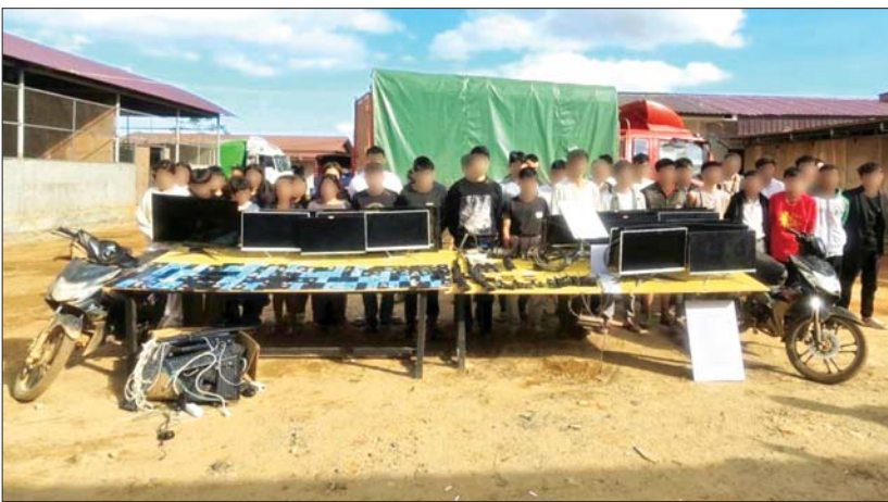
တန့်ယန်းမြို့နယ်၌ တရုတ်နိုင်ငံသား ၁၈ ဦးနှင့် မြန်မာနိုင်ငံသား ၂၇ ဦးတို့အား အွန်လိုင်းအသုံးပြု၍ ငွေလိမ်လုပ်ငန်းလုပ်ကိုင်ရာတွင် အသုံးပြုသည့် ဆက်စပ်ပစ္စည်းများ၊ လက်နက်၊ ခဲယမ်းများနှင့်အတူ ဖမ်းဆီးရမိမှုမှတ်တမ်းဓာတ်ပုံ။

နေပြည်တော် ဒီဇင်ဘာ ၅ လုံခြုံရေးတပ်ဖွဲ့ဝင်များအနေဖြင့် ဒုစရိုက်မှုများ လျော့နည်းပပျောက်ရေးနှင့် အွန်လိုင်းလိမ်လည်မှု လုပ်ငန်းများ တိုက်ဖျက်ရေးအတွက် နယ်မြေအတွင်း သတင်းရယူ စုံစမ်းခြင်းနှင့် အွန်လိုင်းနည်းပညာများအသုံးပြု၍ ပြစ်မှုကျူးလွန်သူများအား ခြေရာခံအတည်ပြုကာ တရားခံများ ဖော်ထုတ်ဖမ်းဆီးရမိနိုင်ရေး စဉ်ဆက်မပြတ် ကြိုးပမ်းဆောင်ရွက်လျက်ရှိသည်။ ထိုသို့ ဆောင်ရွက်လျက်ရှိရာ ၂၀၂၄ ခုနှစ် ဒီဇင်ဘာ ၂ ရက် မွန်းလွဲ ၁ နာရီ ၁၅ မိနစ်တွင် လုံခြုံရေးတပ်ဖွဲ့ဝင်များပါဝင်သော ပူးပေါင်းအဖွဲ့သည် ရှမ်းပြည်နယ်(မြောက်ပိုင်း) တန့်ယန်းမြို့နယ် နောင်ဟီးကျေးရွာရှိ နေအိမ်တစ်လုံး၌ တရုတ်နိုင်ငံသားများနှင့် စာမျက်နှာ ၁၇ ကော်လံ ၁ ။