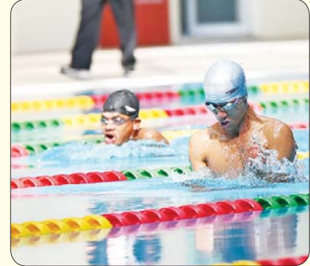
မသန်စွမ်းရေကူးအမျိုးသား S 90.10 မီတာ (၅၀) ရင်ပေါင်တန်းကူးပြိုင်ပွဲ ယှဉ်ပြိုင်နေမှုကို တွေ့ရစဉ်။