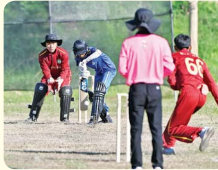
ပြည်နယ်နှင့် တိုင်းဒေသကြီး အမျိုးသား ခရစ်ကတ်ပြိုင်ပွဲတွင် ပြည်ထောင်စုနယ်မြေ နေပြည်တော်အသင်းနှင့် ဧရာဝတီတိုင်း ဒေသကြီးအသင်းတို့ ယှဉ်ပြိုင်ကစားစဉ်။