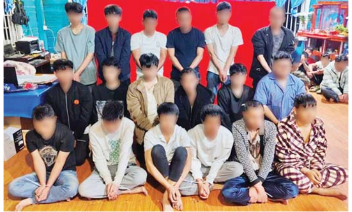
တန့်ယန်းမြို့နယ်၌ အွန်လိုင်းအသုံးပြု၍ ငွေလိမ်လုပ်ငန်းလုပ်ကိုင်နေသည့် တရုတ်နိုင်ငံသား ချိန်လှပါ အမျိုးသား ၁၀ ဦး၏ မှတ်တမ်းဓာတ်ပုံ။

* ကျောဖုံးမှ မြန်မာနိုင်ငံသားများ ပူးပေါင်းကာ အွန်လိုင်းအသုံးပြု၍ ငွေလိမ်လုပ်ငန်းများ လုပ်ကိုင်နေကြောင်း သတင်းရရှိသဖြင့် အဆိုပါ နေအိမ်အားသက်သေများနှင့်အတူ ဝင်ရောက်ရှာဖွေစစ်ဆေးခဲ့သည်။