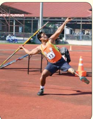
မသန်စွမ်းအမျိုးသား လှံတံပစ်ပြိုင်ပွဲတွင် ဖြိုင်ပွဲဝင်တစ်ဦး၏ ကြိုးစားယှဉ်ပြိုင်ဟန်။