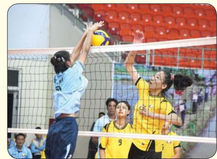
ပြည်နယ်နှင့် တိုင်းဒေသကြီး အမျိုးသမီး ဘောလုံးပြိုင်ပွဲတွင် မန္တလေးတိုင်းဒေသကြီးအသင်းနှင့် ရှမ်းပြည်နယ်အသင်းတို့ ယှဉ်ပြိုင်ကစားစဉ်။