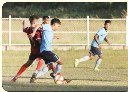
ပြည်နယ်နှင့် တိုင်းဒေသကြီး အမျိုးသား ဘောလုံးပြိုင်ပွဲတွင် ပဲခူးတိုင်းဒေသကြီးအသင်းနှင့် တနင်္သာရီတိုင်းဒေသကြီးအသင်းတို့ ယှဉ်ပြိုင်ကစားစဉ်။