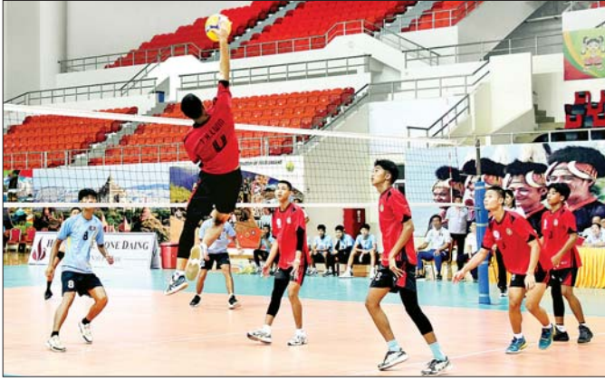
၂၀၂၄ ခုနှစ် ပဉ္စမအကြိမ် အမျိုးသားအားကစားပွဲတော် အားကစားပြိုင်ပွဲ ပြည်နယ်နှင့် တိုင်းဒေသကြီးအသက်(၂၀) နှစ်အောက် ဘော်လီဘောပြိုင်ပွဲ အမျိုးသားဘော်လီဘောပြိုင်ပွဲတွင် ပဲခူးတိုင်းဒေသကြီးအသင်းနှင့် ချင်းပြည်နယ်အသင်းတို့ ယှဉ်ပြိုင်ကစားစဉ်။

မည်သည့်အားကစားနည်းမဆို ကိုယ်တွင်းမှ ထွက်ရှိလာသည့် endorphin ဖော်မုန်းတစ်မျိုးကြောင့် အားကစားသမားများမှာ စိုးရိမ်သောကစိတ်ဓာတ်ကျဝေဒနာများ လျော့ပါးသွားသည့်အတွက် အားကစားကို ကျန်းမာရေးကုထုံးတစ်ခုအသွင် အသုံးပြုသည်ဟု နားလည်လာသည်။ မကြာမီကျင်းပတော့မည့် အမျိုးသားအားကစားပြိုင်ပွဲကြီးကို ဝန်ကြီးဌာနအဆင့် ပြည်နယ်၊ တိုင်းဒေသကြီးအဆင့် နှစ်ဆင့်ကျင်းပမည်ဖြစ်ရာ ဝန်ကြီးဌာနအဆင့်တွင် ပြေးခုန်ပစ်၊ ဘောလုံး၊ ဖူဆယ်ဂေါက်သီး၊ ပိုက်ကျော်ခြင်းနှင့် ဘော်လီဘောကစားနည်း ၆ မျိုး၊ ပြည်နယ်၊ တိုင်းဒေသကြီးအဆင့်တွင် ၎င်း ၆ မျိုးအပါအဝင် ဘတ်စကက်ဘော၊ ကြက်တောင်၊ ဘီလီယက်၊ စနူကာ၊ လက်စွဲ၊ ကာယဗလ၊ ခရစ်ကက်၊ ဂျူဒို၊ ကရာတေး၊ ရေကူး၊ စားပွဲတင်တင်းနစ်၊ တိုက်ကွမ်းခွံ၊ တင်းနစ်၊ ရိုးရာခြင်းလုံးမြန်မာ့သိုင်း၊ ပိုစီနစ်၊ အလေးမနှင့် ဂျူဂိုကစားနည်းပေါင်း ၂၃ မျိုး ပါဝင်မည်ဖြစ်ပါသည်။ အထက်ပါအားကစားနည်းအားလုံးသည် ကစားနည်းတစ်မျိုးချင်းအလိုက် ရုပ်ပိုင်း စိတ်ပိုင်းနှစ်ခုလုံး ကျန်းမာကြံ့ခိုင်သန်စွမ်းမှုများစွာကိုပေးသော အားကစားနည်းများဖြစ်ကြသည်။ သို့ဖြစ်၍ ကစားနည်းအလိုက် အကျိုးကျေးဇူးများ မည်သို့ရရှိကြမည်သို့အကျိုးဖြစ်ထွန်းကြောင်း အားကစားတစ်ခုချင်း၏ အနှစ်သာရများကို ဤနေရာကနေ ရေးသားဖော်ပြလိုပါသည်။