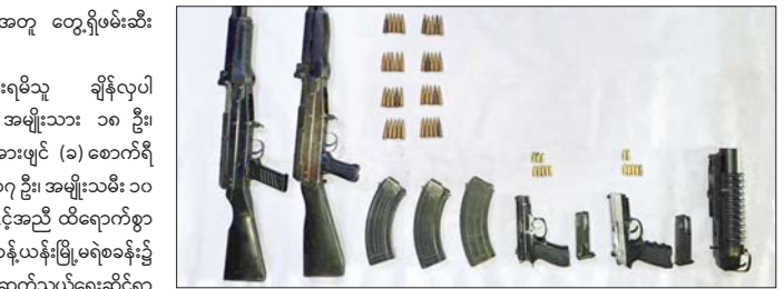
တန့်ယန်းမြို့နယ်၌ အွန်လိုင်းအသုံးပြု၍ ငွေလိမ်လုပ်ငန်းလုပ်ကိုင်သူများအား ဖမ်းဆီး ရမိမှုမှ CZ 75 D 9MM အမျိုးအစားပစ္စုတို သေနတ်တစ်လက်၊ ကျည်ရစ်တောင့်၊ Beretta 9MM အမျိုးအစားပစ္စုတို သေနတ်တစ်လက်၊ ကျည်ခွန်တောင့်၊ Type-81 အမျိုးအစားသေနတ်နှစ်လက်၊ ကျည်အိမ်သုံးခု၊ ကျည်အတောင့် ၄၀၊ ၄၀ မမ ပြောင်းတစ်ခု သိမ်းဆည်းရမိမှု မှတ်တမ်းဓာတ်ပုံ။

အမျိုးသား ၁၇ ဦးနှင့် အမျိုးသမီး ၁၀ ဦး တို့အား အွန်လိုင်းအသုံးပြု၍ ငွေလိမ် လုပ်ငန်းပြုလုပ်ရာတွင် အသုံးပြုသည့် ကွန်ပျူတာမျိုးစုံ ၂၆ လုံး၊ ဆက်စပ်ပစ္စည်း ၂၆ မျိုး၊ Star Link တစ်စုံ၊ ဖုန်းမျိုးစုံ အလုံး ၁၃၀ နှင့် CZ 75 D 9MM အမျိုးအစားပစ္စုတို သေနတ်တစ်လက်၊ ကျည်ရစ်တောင့်၊ Beretta 9MM အမျိုးအစားပစ္စုတို သေနတ် တစ်လက်၊ ကျည်ခွန်တောင့်၊ Type-81 အမျိုးအစားသေနတ်နှစ်လက်၊ ကျည်အိမ် သုံးခု၊ ကျည်အတောင့် ၄၀၊ ၄၀ မမပြောင်း တစ်ခု၊ စကားပြောစက် ခြောက်လုံး၊ ဆိုင်ကယ်နှစ်စီး၊ မီးစက်တစ်လုံး၊ WIFI စက်သုံးလုံး၊ DONG FENG ခြောက်ဘီး