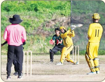
ပြည်နယ်နှင့် တိုင်းဒေသကြီး အမျိုးသား ခရစ်ကတ်ပြိုင်ပွဲတွင် မွန်ပြည်နယ်အသင်းနှင့် ရန်ကုန်တိုင်းဒေသကြီးအသင်းတို့ ယှဉ်ပြိုင် ကစားစဉ်။