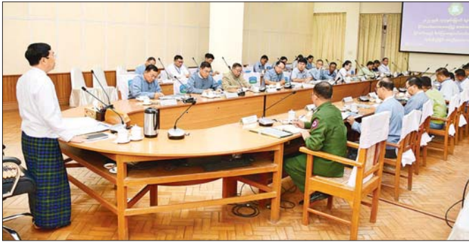
ဆုံးဖြတ်ချက်များနှင့် လမ်းညွှန် ချက်များအပေါ် ဆက်ကော်မတီ အဖွဲ့ဝင်များနှင့် လုပ်ငန်းအဖွဲ့များ မှ တာဝန်ရှိသူများအနေဖြင့် ဆောင်ရွက်ရန် ကျန်ရှိသည့် လုပ်ငန်းများကိုအချိန်မီပြီးစီးအောင် ဆောင်ရွက်သွားကြရန် လိုအပ်ပြီး အခြားသော ဆက်ကော်မတီများ နှင့်လည်း အချိန်မီ ကြိုတင်၍ ပေါင်းစပ်ညှိနှိုင်း ဆောင်ရွက် သွားကြရန် လိုအပ်ကြောင်း၊ လုပ်ငန်းများ ဆောင်ရွက်ရာတွင်

နေပြည်တော် ဒီဇင်ဘာ ၅ ၂၀၂၅ ခုနှစ် (၇၇) နှစ်မြောက် လွတ်လပ်ရေးနေ့ နိုင်ငံတော်အလံ အလေးပြုပွဲအခမ်းအနား ကျင်းပ ရေး၊ ပြင်ဆင်ရေးနှင့် ဖိတ်ကြား ရေးဆပ်ကော်မတီ၏ ဒုတိယ အကြိမ် လုပ်ငန်းညှိနှိုင်းအစည်း အဝေးကို ယနေ့နံနက်ပိုင်းက နေပြည်တော် စည်ပင်သာယာရေး ကော်မတီ အစည်းအဝေးခန်းမ၌ ကျင်းပသည်။