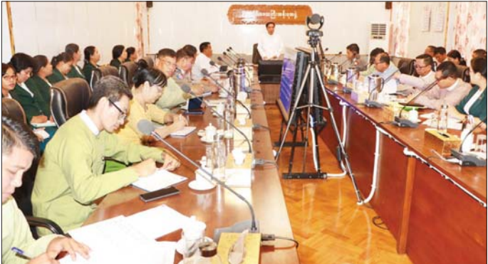
နှစ်တွင် အခွန်အရပ်ရပ်ကောက်ခံရန် အခွန်အမျိုးအစားငါးမျိုး အပေါ် မူလလျာထားချက်အပေါ် (စာ) ရာခိုင်နှုန်း ကောက်ခံရရှိထားပြီးဖြစ်၍ ကျန်ရှိသည့် လများတွင် လျာထားချက်ပြည့်စီကျော်လွန်အောင် ကြိုးစားကောက်ခံသွားကြစေလိုကြောင်း၊ ပြည်သူများတွင်လည်း အခွန်ဆောင်သည့်ယဉ်ကျေးမှုတစ်ရပ်

ပဲခူး ဒီဇင်ဘာ ၅ ပဲခူးတိုင်းဒေသကြီး အစိုးရအဖွဲ့ရုံး အစည်းအဝေး ခန်းမ၌ ဒီဇင်ဘာ ၅ ရက် နံနက်ပိုင်းက တိုင်းဒေသကြီးဝန်ကြီးချုပ်ဦးမျိုးဆွေဝင်းဦးဆောင်၍ တိုင်းဒေသကြီးအတွင်း အခွန်အရပ်ရပ်တိုးတက်ကောက်ခံရရှိရေးနှင့် ပြေစာအပေါ် အခွန်အမှတ်တံဆိပ်ကပ်နှိပ်ဆောင်ရွက်ရမည့်လုပ်ငန်းများမှ အခွန်တိုးတက်ကောက်ခံရရှိရေး လုပ်ငန်းညှိနှိုင်းအစည်းအဝေး ကျင်းပသည်။ (ယာဝု) ဦးစွာ တိုင်းဒေသကြီးဝန်ကြီးချုပ်က အခွန်ကောက်ခံရရှိမှုသည် တိုင်းဒေသကြီးအတွင်း ဒေသဖွံ့ဖြိုးရေးလုပ်ငန်းများကို ပိုမိုဆောင်ရွက်ပုံဖော်နိုင်သည့် ကဏ္ဍတစ်ရပ်ဖြစ်၍ ရသင့်ရထိုက်သည့် အခွန်များ အပြည့်အဝကောက်ခံရရှိရေး၊ အခွန်ထမ်းပြည်သူများအတွက် အခွန်ဝန်ထုပ်ဝန်ပိုးမဖြစ်စေရေးနှင့် ညီညွတ်မျှတသော အခွန်အခများရရှိရမည်အလွန်အရေးကြီးကြောင်း၊ ၂၀၂၄-၂၀၂၅ ဘဏ္ဍာ