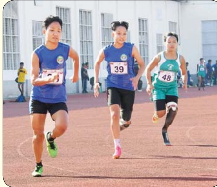
မသန်စွမ်းအမျိုးသမီး မီတာ (၂၀၀) အပြေးပြိုင်ပွဲ ယှဉ်ပြိုင်နေမှုကို တွေ့ရစဉ်။