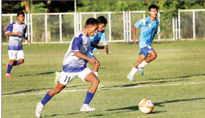
ပြည်နယ်နှင့် တိုင်းဒေသကြီး အသက်(၂၁)နှစ်အောက် အမျိုးသားဘောလုံးပြိုင်ပွဲတွင် စစ်ကိုင်းတိုင်း ဒေသကြီးအသင်းနှင့် ကချင်ပြည်နယ်အသင်းတို့ ယှဉ်ပြိုင်ကစားစဉ်။

တစ်ဖက် ၂ ဂိုးစီဖြင့်လည်းကောင်း၊ သမဝါယမနှင့် ကျေးလက်ဖွံ့ဖြိုး ရေးဝန်ကြီးဌာနအသင်းက လူမှု ဝန်ထမ်း၊ ကယ်ဆယ်ရေးနှင့် ပြန်လည်နေရာချထားရေးဝန်ကြီး ဌာနအသင်းကို ၂ ဂိုး-၀ ရှုံးဖြင့်လည်း ကောင်း အနိုင်ရရှိခဲ့ကြသည်။ ယနေ့ကျင်းပသည့်အားကစား ပြိုင်ပွဲများသို့ ပြည်ထောင်စုအဆင့် ပုဂ္ဂိုလ်များ၊ ဒုတိယဝန်ကြီးများ၊ တိုင်းဒေသကြီးနှင့် ပြည်နယ် အစိုးရအဖွဲ့ဝန်ကြီးများ၊ ဌာန ဆိုင်ရာများ၊ အားကစားနည်း အလိုက် အဖွဲ့ချုပ်များမှ တာဝန် ရှိသူများ၊ ဝန်ထမ်းများ၊ ကျောင်း အသင်းနှင့် ရှမ်းပြည်နယ်အသင်း ဝါသနာရှင်ပြည်သူများ စိတ်ပါ ဝင်စားစွာ လာရောက်ကြည့်ရှု အားပေးခဲ့ကြသည်။ အမျိုးသား/သမီး နှစ်ယောက် တွဲ ပိုက်ကစားခြင်းပြိုင်ပွဲ ဆီမီး ဖိုင်နယ်ပွဲစဉ်များနှင့် ဗိုလ်လုပွဲကို ဝဏ္ဏသိဒ္ဓိအားကစားကွင်း (A) ရှမ်း လည်းကောင်း၊ ပြည်နယ်နှင့် တိုင်းဒေသကြီး လက်ပေါ်ပြိုင်ပွဲကို ဝဏ္ဏသိဒ္ဓိအားကစားကွင်းလက်ပေါ် ရှည်လည်းကောင်း ဒီဇင်ဘာ ၆ ရက် နံနက်ပိုင်းမှစတင်၍ ယှဉ်ပြိုင် ကစားသွားကြမည် ဖြစ်ရာ အားကစားဝါသနာရှင် မိဘပြည်သူများအနေဖြင့် မည်သူ မဆို လာရောက်ကြည့်ရှုအားပေး နိုင်ကြောင်း သိရသည်။ သတင်းစဉ်