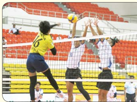
ပြည်နယ်နှင့် တိုင်းဒေသကြီး အမျိုးသား ဘောလုံးပြိုင်ပွဲတွင် ကရင်ပြည်နယ်အသင်းနှင့် ပဲခူးတိုင်းဒေသကြီးအသင်းတို့ ယှဉ်ပြိုင် ကစားစဉ်။