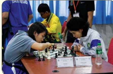
အမျိုးသမီးမျက်မမြင် စစ်တုရင်ပြိုင်ပွဲ ယှဉ်ပြိုင်နေမှုကို တွေ့ရစဉ်။