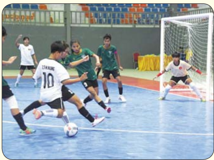
ပြည်နယ်နှင့် တိုင်းဒေသကြီး အမျိုးသမီး ဖူဆယ်ဘောလုံးပြိုင်ပွဲ တွင် တနင်္သာရီတိုင်းဒေသကြီးအသင်းနှင့် မွန်ပြည်နယ်အသင်းတို့ ယှဉ်ပြိုင်ကစားစဉ်။