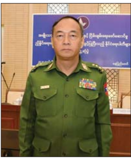
ဗိုလ်မှူးကြီး ဝဏ္ဏအောင်

ဒေါက်တာအောင်မြတ်ဦး ဗဟိုကော်မတီဝင်၊ ပြည်ထောင်စု ကြံ့ခိုင်ရေးနှင့်ဖွံ့ဖြိုးရေးပါတီ အခုလို နိုင်ငံရေးပါတီတွေနဲ့ တွေ့ဆုံ ဆွေးနွေးပွဲတွေ၊ NSPC က ဆောင်ရွက် ပေးတဲ့ဆွေးနွေးပွဲတွေ၊ အခြားနိုင်ငံတွေရဲ့