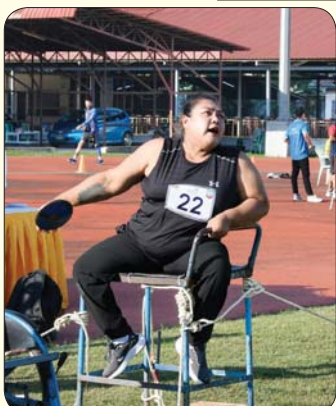
မသန်စွမ်းအမျိုးသမီး သံပြားပစ်ပြိုင်ပွဲတွင် ဖြိုင်ပွဲဝင်တစ်ဦး ယှဉ်ပြိုင်နေမှုကို တွေ့ရစဉ်။