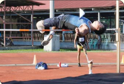
မသန်စွမ်းအမျိုးသား တန်းမြင့်ခုန်ပြိုင်ပွဲတွင် ဖြိုင်ပွဲဝင်တစ်ဦး ယှဉ်ပြိုင်နေမှုကို တွေ့ရစဉ်။