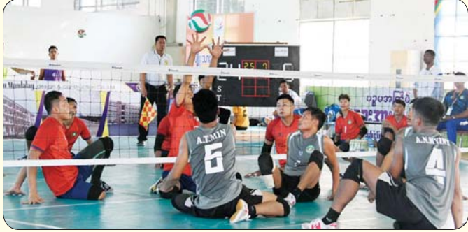
မသန်စွမ်းအမျိုးသား ထိုင်လျက်ဘော်လီဘောပြိုင်ပွဲ ယှဉ်ပြိုင်နေမှုကို တွေ့ရစဉ်။