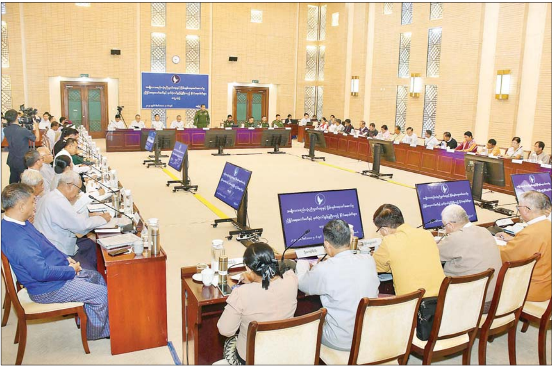
အမျိုးသားစည်းလုံးညီညွတ်ရေးနှင့် ငြိမ်းချမ်းရေးဖော်ဆောင်မှုညှိနှိုင်းရေးကော်မတီနှင့် မှတ်ပုံတင်ခွင့်ပြုပြီးသည့် နိုင်ငံရေးပါတီများ တွေ့ဆုံစဉ်။

နေပြည်တော် ဒီဇင်ဘာ ၅ အမျိုးသား စည်းလုံးညီညွတ်ရေးနှင့် ငြိမ်းချမ်းရေးဖော်ဆောင်မှု ညှိနှိုင်းရေး ကော်မတီနှင့် မှတ်ပုံတင်ခွင့်ပြုပြီးသည့် နိုင်ငံရေးပါတီများတွေ့ဆုံပွဲကို ယနေ့ နံနက်ပိုင်းတွင် နေပြည်တော်ရှိ အမျိုးသား စည်းလုံးညီညွတ်ရေးနှင့် ငြိမ်းချမ်းရေး ဖော်ဆောင်မှုဗဟိုဌာန၌ ကျင်းပသည်။ တွေ့ဆုံပွဲသို့ နယ်စပ်ရေးရာဝန်ကြီးဌာန ပြည်ထောင်စုဝန်ကြီး၊ အမျိုးသား စည်းလုံးညီညွတ်ရေးနှင့် ငြိမ်းချမ်းရေး ဖော်ဆောင်မှုညှိနှိုင်းရေးကော်မတီဥက္ကဋ္ဌ ဒုတိယဗိုလ်ချုပ်ကြီး ထွန်းထွန်းနောင်နှင့် ညှိနှိုင်းရေးကော်မတီဝင်များ၊ မှတ်ပုံတင် ခွင့်ပြုပြီးသည့် နိုင်ငံရေးပါတီ ၅၁ ပါတီမှ ဥက္ကဋ္ဌ ဒုတိယဥက္ကဋ္ဌ အတွင်းရေးမှူး၊ ဗဟို အလုပ်အမှုဆောင်ကော်မတီဝင်များနှင့် တာဝန်ရှိသူများ တက်ရောက်ကြသည်။ တွေ့ဆုံပွဲတွင် အမျိုးသားစည်းလုံး ညီညွတ်ရေးနှင့် ငြိမ်းချမ်းရေးဖော်ဆောင် မှုညှိနှိုင်းရေးကော်မတီဥက္ကဋ္ဌ ဒုတိယ ဗိုလ်ချုပ်ကြီး ထွန်းထွန်းနောင်က အဖွင့် အမှာစကားပြောကြားရာ၌ မြန်မာနိုင်ငံ နှင့်သဟဇာတဖြစ်နိုင်မည့် ဖက်ဒရယ်စနစ် ကျင့်သုံးနိုင်ရေးအတွက် လေ့လာတွေ့ရှိ ချက်များနှင့် မတူကွဲပြားမှုများကို နားလည်လက်ခံပြီး ပြည်ထောင်စု စာမျက်နှာ ၇ ကော်လံ ၁