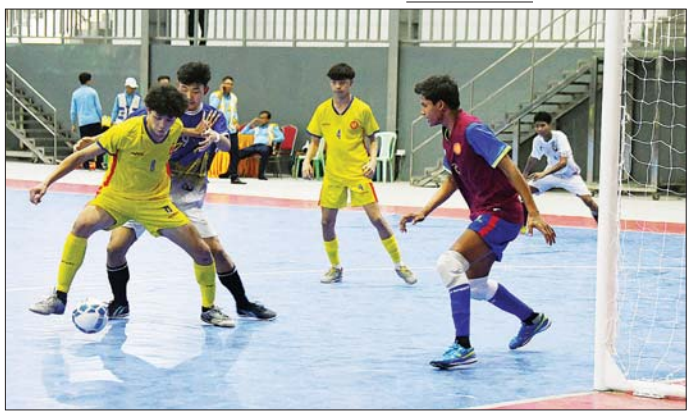
ပြည်နယ်နှင့် တိုင်းဒေသကြီး ဖူဆယ်ပြိုင်ပွဲ အမျိုးသားဖူဆယ်ဘောလုံးပြိုင်ပွဲတွင် မွန်ပြည်နယ်အသင်းနှင့် စစ်ကိုင်းတိုင်းဒေသကြီးအသင်းတို့ ယှဉ်ပြိုင်ကစားစဉ်။

ဘတ်စကက်ဘော ပြိုင်ပွဲများကျင်းပ ပြည်နယ်နှင့် တိုင်းဒေသကြီး အသက်(၂၃)နှစ်အောက် အမျိုးသား ဘတ်စကက်ဘောပြိုင်ပွဲကို ဧရာဝတီတိုင်းဒေသကြီးအသင်းက ရမှတ် (၅၇-၄၀) မှတ်၊ မန္တလေးတိုင်းဒေသကြီးအသင်းက စစ်ကိုင်းတိုင်းဒေသကြီးအသင်းကို ရမှတ် (၉၆-၅၄) မှတ်၊ ကရင်ပြည်နယ်အသင်းက ဧရာဝတီတိုင်းဒေသကြီးအသင်းကို ရမှတ် (၈၆-၅၂) မှတ်၊ ရှမ်းပြည်နယ်အသင်းက မွန်ပြည်နယ်အသင်းကို ရမှတ် (၉၂-၄၃) မှတ်၊ ရန်ကုန်တိုင်းဒေသကြီးအသင်းက ကရင်ပြည်နယ်အသင်းကို ရမှတ် (၇၅-၆၅) မှတ် ဖြင့် အနိုင်ရရှိခဲ့ကြသည်။ ဘော်လီဘောပြိုင်ပွဲများကျင်းပ ပြည်နယ်နှင့် တိုင်းဒေသကြီး အသက်(၂၀)နှစ်အောက် ဘော်လီဘောပြိုင်ပွဲများကို ဝဏ္ဏသိဒ္ဓိ အားကစားကွင်း ဖူဆယ်အားကစားရုံကျင်းပရာ အမျိုးသားဖူဆယ်ဘောလုံးပြိုင်ပွဲတွင် တနင်္သာရီတိုင်းဒေသကြီးအသင်းက ကရင်ပြည်နယ်အသင်းကို ၂ ရိုး - ၁ ရိုး၊ ဧရာဝတီတိုင်းဒေသကြီးအသင်းက ရခိုင်ပြည်နယ်အသင်းကို ၁ ရိုး-ရိုးမရှိ၊ စစ်ကိုင်းတိုင်းဒေသကြီးအသင်းက မွန်ပြည်နယ်အသင်းကို ၅ ရိုး-၁ ရိုး၊ မကွေးတိုင်းဒေသကြီးအသင်းက ရှမ်းပြည်နယ်အသင်းကို ၁ ရိုး-ရိုးမရှိ၊ ပဲခူးတိုင်းဒေသကြီးအသင်းက ပြည်ထောင်စုနယ်မြေ နေပြည်တော်အသင်းကို ၂ ရိုး - ရိုးမရှိဖြင့် လည်းကောင်း အနိုင်ရရှိခဲ့ကြသည်။ အမျိုးသမီး ဖူဆယ်ဘောလုံးပြိုင်ပွဲတွင် ဧရာဝတီတိုင်းဒေသကြီးအသင်းနှင့် မန္တလေးတိုင်းဒေသကြီးအသင်းတို့က ရိုးမရှိသရေ၊ စစ်ကိုင်းတိုင်းဒေသကြီးအသင်းနှင့် ရခိုင်ပြည်နယ်အသင်းတို့က စာမျက်နှာ ၁၃ သို့