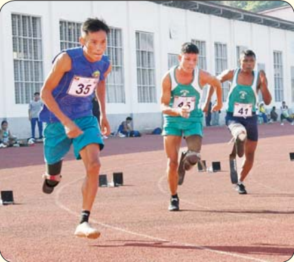
မသန်စွမ်းအမျိုးသား မီတာ (၂၀၀) အပြေးပြိုင်ပွဲ ယှဉ်ပြိုင်နေမှုကို တွေ့ရစဉ်။