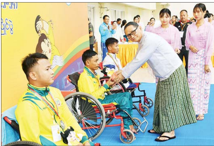
နိုင်ငံတော်စီမံအုပ်ချုပ်ရေးကောင်စီအဖွဲ့ဝင် ဒေါက်တာမူထန် မသန်စွမ်းရေးကူး အမျိုးသား 54/5 မီတာ(၅၀) အလွတ်ကူးပြိုင်ပွဲတွင် ပထမဆုရ ရန်ကုန်တိုင်းဒေသကြီးမှ ပြိုင်ပွဲဝင်အား ဂုဏ်ပြုဆုတံဆိပ်နှင့် အမျိုးသား အားကစားပွဲတော် အထိမ်းအမှတ်အရပ်အား ပေးအပ်ချီးမြှင့်စဉ်။

( ၃-၉-၂၀၂၄ ရက်နေ့တွင် နိုင်ငံတော်စီမံအုပ်ချုပ်ရေးကောင်စီဥက္ကဋ္ဌ နိုင်ငံတော်ဝန်ကြီးချုပ် ဗိုလ်ချုပ်မှူးကြီး မင်းအောင်လှိုင် ရှမ်းပြည်နယ်အစိုးရအဖွဲ့ဝင်များ၊ ပြည်နယ်နှင့် ခရိုင်အဆင့်ဌာနဆိုင်ရာတာဝန်ရှိသူများအား ပြောကြားသည့် အမှာစကားမှ ကောက်နုတ်ချက် )