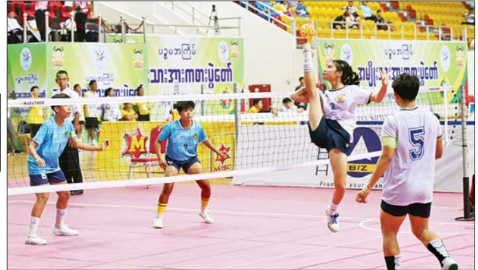
ပြည်နယ်နှင့် တိုင်းဒေသကြီး ပိုက်ကစားခြင်းပြိုင်ပွဲ အမျိုးသမီးနှစ်ယောက်တွဲ ပိုက်ကစားခြင်းပြိုင်ပွဲတွင် မွန်ပြည်နယ်အသင်းနှင့် ပဲခူးတိုင်းဒေသကြီးအသင်းတို့ ယှဉ်ပြိုင်ကစားစဉ်။