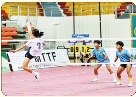
ပြည်နယ်နှင့် တိုင်းဒေသကြီး အမျိုးသမီး ပိုက်ကျော်ခြင်းပြိုင်ပွဲ တွင် မွန်ပြည်နယ်အသင်းနှင့် ပဲခူးတိုင်းဒေသကြီးအသင်းတို့ ယှဉ်ပြိုင် ကစားစဉ်။