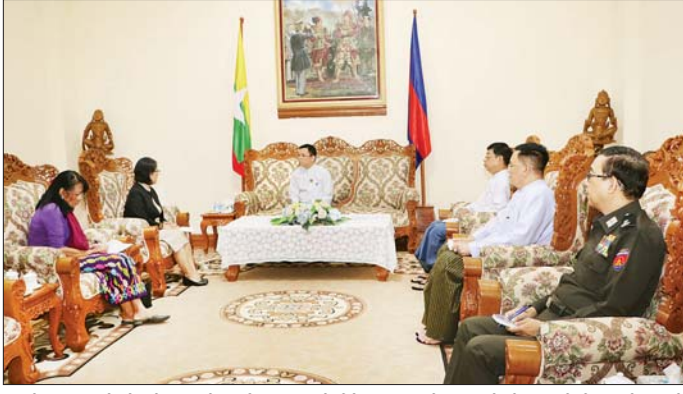
လက်ခံရေး လုပ်ငန်းစဉ်အတွက် တို့ သုံးပွင့်ဆိုင် နားလည်မှု လုပ်ငန်းများ ထိထိရောက်ရောက် ဝန်ကြီးဌာနနှင့် UNDP - UNHCR စာချုပ်လွှာ MoU မူဘောင်အရ အကောင်အထည်ဖော် ဆောင်

နေပြည်တော် ဒီဇင်ဘာ ၅ လူဝင်မှုကြီးကြပ်ရေးနှင့် ပြည်သူ့ အင်အားဝန်ကြီးဌာန ပြည်ထောင်စု ဝန်ကြီး ဦးမြင့်ကြိုင်သည် ကုလသမဂ္ဂဒုက္ခသည်များဆိုင်ရာ မဟာမင်းကြီးရုံး (UNHCR) ၏ မြန်မာနိုင်ငံဆိုင်ရာ ဌာနကိုယ်စားလှယ် Ms. Noriko Takagi နှင့်အဖွဲ့ကို ယနေ့ဖွဲ့နွဲ့လွှဲ ပိုင်းတွင် နေပြည်တော်ရှိ လူဝင်မှု ကြီးကြပ်ရေးနှင့် ပြည်သူ့အင်အား ဝန်ကြီးဌာန ပြည်ထောင်စုဝန်ကြီး ၏ ဧည့်ခန်းမ၌ လက်ခံတွေ့ဆုံ သည်။ (ယာပုံ)