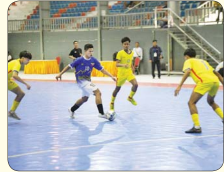
ပြည်နယ်နှင့် တိုင်းဒေသကြီး အမျိုးသား ဖူဆယ်ဘောလုံးပြိုင်ပွဲ တွင် မွန်ပြည်နယ်အသင်းနှင့် စစ်ကိုင်းတိုင်းဒေသကြီးအသင်းတို့ ယှဉ်ပြိုင်ကစားစဉ်။