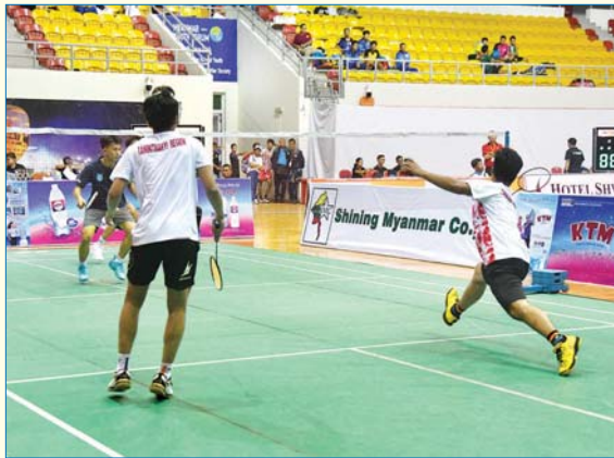
ပြည်နယ်နှင့်တိုင်းဒေသကြီး အမျိုးသား ကြက်တောင်ရိုက်ပြိုင်ပွဲတွင် ကချင်ပြည်နယ် အသင်းနှင့် တနင်္သာရီတိုင်းဒေသကြီးအသင်းတို့ ယှဉ်ပြိုင်ကစားစဉ်။

၂၀၂၄ ခုနှစ် ပဉ္စမအကြိမ် အမျိုးသား အားကစားပွဲတော် အားကစားပြိုင်ပွဲ အုပ်စုပွဲစဉ်များနှင့် ကွာထားဗိုင်းနယ် ပွဲစဉ်များ ယှဉ်ပြိုင်မှု ဓာတ်ပုံပြင်ကွင်း ၂၁-၂-၂၀၂၄