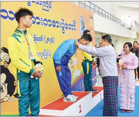
ပြည်ထောင်စုဝန်ကြီး ဦးမင်းသိန်းက မသန်စွမ်းရေးကူးအမျိုးသား 59/10 မီတာ(၅၀) အလွတ်ကူးပြိုင်ပွဲတွင် ပထမဆုရ ပဲခူးတိုင်းဒေသကြီးမှ ပြိုင်ပွဲဝင်အား ဂုဏ်ပြု ဆုတံဆိပ်နှင့် အမျိုးသားအားကစားပွဲတော် အထိမ်းအမှတ်အရပ်အား ပေးအပ် ချီးမြှင့်စဉ်။

ရေးကောင်စီအဖွဲ့ဝင် ဒေါက်တာမူထန်က နှင့် တတိယဆုရရှိသည့် ပြည်ထောင်စု မသန်စွမ်း ရေကူးအမျိုးသား 54/5 မီတာ နယ်မြေ နေပြည်တော်အသင်းတို့မှပြိုင်ပွဲ (၅၀) အလွတ်ကူးပြိုင်ပွဲတွင် ပထမဆုနှင့် ဝင် များကိုလည်းကောင်း၊ အမျိုးသား ဒုတိယဆုရရှိသည့်ရန်ကုန်တိုင်းဒေသကြီး 54/5 မီတာ(၅၀) စာမျက်နှာ ၄ သို့