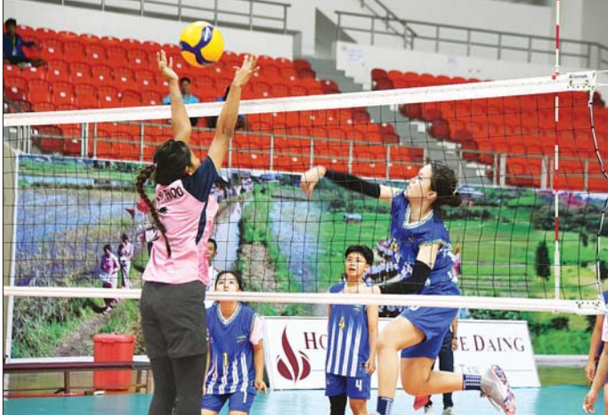
ပြည်နယ်နှင့် တိုင်းဒေသကြီး အသက်(၂၀)နှစ်အောက် ဘော်လီဘောပြိုင်ပွဲ အမျိုးသမီးပြိုင်ပွဲတွင် တနင်္သာရီတိုင်းဒေသကြီးအသင်းနှင့် ကချင်ပြည်နယ်အသင်းတို့ ယှဉ်ပြိုင်ကစားစဉ်။

ဖြင့်လည်းကောင်း၊ အမျိုးသမီး က ပြည်ထောင်စုနယ်မြေ နေပြည်တော်အသင်းကို ၃ ပွဲ-၁ ပွဲ၊ မန္တလေးတိုင်းဒေသကြီး ပြည်နယ်အသင်းကို ၃ ပွဲပြတ်၊ အသင်းက ကရင်ပြည်နယ်အသင်းကို ၃ ပွဲပြတ်၊ ဧရာဝတီတိုင်းဒေသကြီးအသင်းက ဧရာဝတီတိုင်းဒေသကြီးကို ၃ ပွဲပြတ်ဖြင့်လည်းကောင်း၊ အနိုင်ရရှိခဲ့သည်။ ခရစ်ကတ်ပြိုင်ပွဲများကျင်းပ ပြည်နယ်နှင့် တိုင်းဒေသကြီး