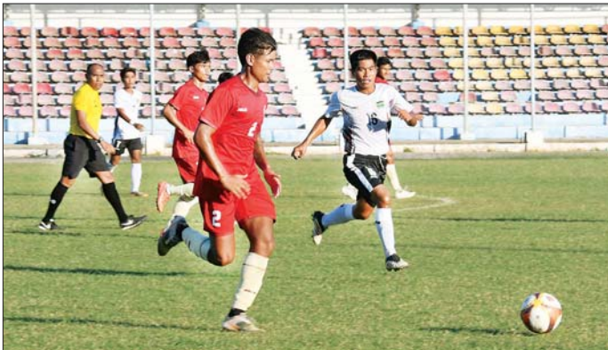
ဝန်ကြီးဌာနပေါင်းစုံ အလွတ်တန်း အမျိုးသားဘောလုံးပြိုင်ပွဲတွင် နယ်စပ်ရေးရာဝန်ကြီးဌာနအသင်း နှင့် ပြည်ထောင်စုဝန်ကြီးဌာနအသင်းတို့ ယှဉ်ပြိုင်ကစားစဉ်။

တစ်ဖက် ၁ ဂိုး၊ ကချင်ပြည်နယ် အသင်းက မကွေးတိုင်းဒေသကြီး အသင်းကို ၂ ဂိုး-၀ ရှုံး၊ မွန်ပြည်နယ်အသင်းက တနင်္သာရီ တိုင်းဒေသကြီးအသင်းကို ၂ ဂိုး-၀ ရှုံး၊ ရှမ်းပြည်နယ်အသင်းက ပဲခူးတိုင်းဒေသကြီး အသင်းကို ၃ ဂိုး-၀ ရှုံး၊ မြန်မာပြည်လည်းကောင်း အနိုင်ရရှိခဲ့ကြသည်။ ပိုက်ကစားခြင်းပြိုင်ပွဲများကျင်းပ ပြည်နယ်နှင့် တိုင်းဒေသကြီး ပိုက်ကစားခြင်းပြိုင်ပွဲကို ဝဏ္ဏသိဒ္ဓိ အားကစားကွင်း (A) ရှမ်းပြည်နယ် အမျိုးသား နှစ်ယောက်တွဲ ပိုက်ကစားခြင်းပြိုင်ပွဲတွင် မကွေး တိုင်းဒေသကြီးအသင်းက ပဲခူး တိုင်းဒေသကြီးအသင်းကို ၂ ပွဲ-၀ ပွဲ၊ မန္တလေးတိုင်းဒေသကြီး အသင်းက ဧရာဝတီတိုင်းဒေသ ကြီးအသင်းကို ၂ ပွဲပြတ်၊ ကရင် ပြည်နယ်အသင်းက ရှမ်းပြည်နယ် အသင်းကို ၂ ပွဲ-၀ ပွဲ၊ ရန်ကုန်တိုင်း ဒေသကြီးအသင်းက ချင်းပြည်နယ် အသင်းကို ၂ ပွဲပြတ်၊ မွန်ပြည်နယ် အသင်းက ရခိုင်ပြည်နယ်အသင်း ကို ၂ ပွဲပြတ်၊ တနင်္သာရီတိုင်း ဒေသကြီးအသင်းက ပြည်ထောင်စု နယ်မြေ နေပြည်တော်အသင်းကို ၂ ပွဲပြတ်၊ စစ်ကိုင်းတိုင်းဒေသကြီး အသင်းက ကယားပြည်နယ် အသင်းကို ၂ ပွဲပြတ်ဖြင့်လည်း ကောင်း အနိုင်ရရှိခဲ့ကြသည်။