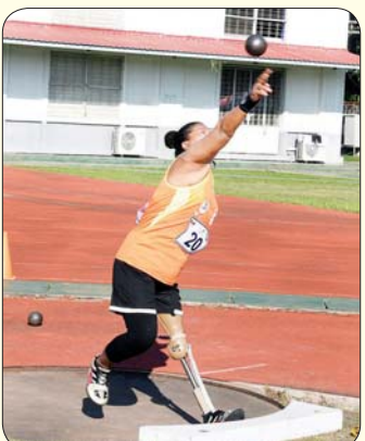
မသန်စွမ်းအမျိုးသမီး သံလုံးပစ်ပြိုင်ပွဲတွင် ဖြိုင်ပွဲဝင်တစ်ဦး ယှဉ်ပြိုင်နေမှုကို တွေ့ရစဉ်။