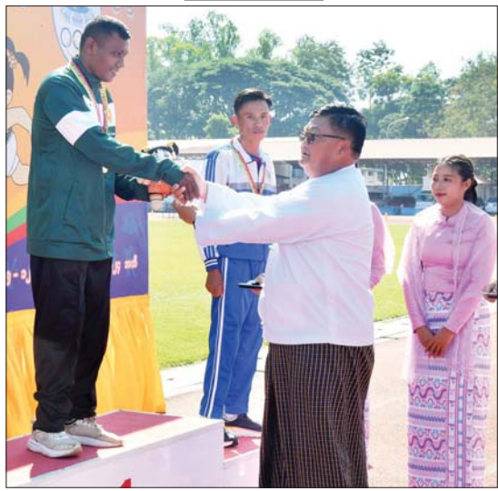
နိုင်ငံတော်စီမံအုပ်ချုပ်ရေးကောင်စီအဖွဲ့ဝင် ဦးရန်ကျော် အမျိုးသားသံလုံးပစ် F 56/57 ပြိုင်ပွဲတွင် ပထမဆုရ ဧရာဝတီတိုင်းဒေသကြီးမှ ပြိုင်ပွဲဝင်အား ဂုဏ်ပြု ဆုတံဆိပ်နှင့် အထိမ်းအမှတ်အရုပ်အား ပေးအပ်ချီးမြှင့်စဉ်။

ဝင်များကိုလည်းကောင်း၊ ဂုဏ်ပြုဆုတံဆိပ် နှင့် အမျိုးသားအားကစားပွဲတော်အထိမ်း အမှတ်အရုပ်အား ပေးအပ်ချီးမြှင့်သည်။ ၂၀၂၄ ခုနှစ် ပဉ္စမအကြိမ် အမျိုးသား အားကစားပွဲတော် မသန်စွမ်းအားကစား ပြိုင်ပွဲများဖြစ်သည့် အမျိုးသား/အမျိုးသမီး ဆက်လက်ကျင်းပသွားမည်ဖြစ်ကြောင်း ပြေးခုန်ပစ်ပြိုင်ပွဲ၊ အမျိုးသား/အမျိုးသမီး