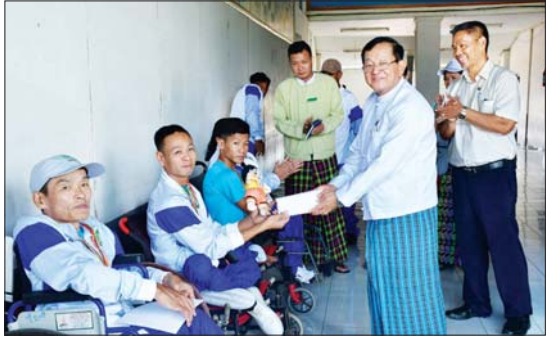
လယ်ဝေး ဒီဇင်ဘာ ၅ ၂၀၂၄ ခုနှစ် ပဉ္စမအကြိမ် အမျိုးသားအားကစားပွဲတော် မသန်စွမ်းအားကစားပြိုင်ပွဲများကို ယနေ့နံနက်ပိုင်းမှစ၍ လယ်ဝေးမြို့နယ် အားကစားလေ့ကျင့်ရေးစခန်း အမှတ်(၂) ၌ ကျင်းပသည်။ ဂုဏ်ပြုချီးမြှင့်ငွေများ ပေးအပ်အဆိုပါ မသန်စွမ်းအားကစားပြိုင်ပွဲများဖြစ်သည့် ပြေးခုန်ပစ်အားကစားနှင့် နည်းပညာအားကစားများ၊ ထိုင်လျက်ဘော်လီဘောနှင့် စစ်တရုင် အားကစားပြိုင်ပွဲများတွင် ဝင်ရောက်ယှဉ်ပြိုင်ကြသည့် အားကစား

သမားများအား နေပြည်တော်ကောင်စီဝင် ဦးမြင့်စိုးက လာရောက်ကြည့်ရှု အားပေးသည်။ ဆက်လက်၍ မသန်စွမ်းအားကစားပြိုင်ပွဲထိုင်လျက်ဘော်လီဘောနှင့် ရေကူးပြိုင်ပွဲများတွင်ဆုရရှိခဲ့သည့် ပြည်ထောင်စုပွဲများ ပေးအပ်သည်။ (ဝဲပုံ) ထို့နောက် ပြိုင်ပွဲဝင်အားကစားသမားများအား ဂုဏ်ပြုချီးမြှင့်ငွေများ ပေးအပ်သည်။ (ဝဲပုံ) ထို့နောက် ပြိုင်ပွဲဝင်အားကစားသမားများ စားသောက်ရာတွင် သန့်ရှင်းမှုရှိစေရေးနှင့် ကျန်းမာရေး စောင့်ရှောက်ပေးနေမှုများကို