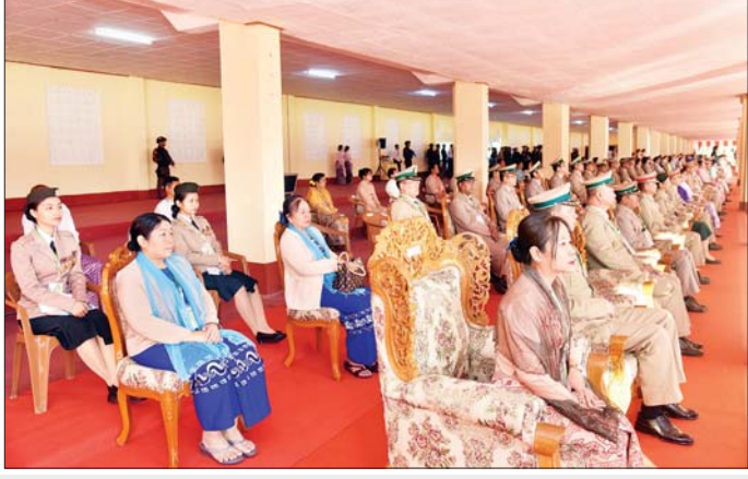
တပ်မတော်ဆေးတက္ကသိုလ် ဗိုလ်လောင်းသင်တန်းအမှတ်စဉ်(၂၅) သင်တန်းဆင်းဂုဏ်ပြုစစ်ရေးပြအခမ်းအနားသို့ တက်ရောက်လာကြသူများအား တွေ့ရစဉ်။