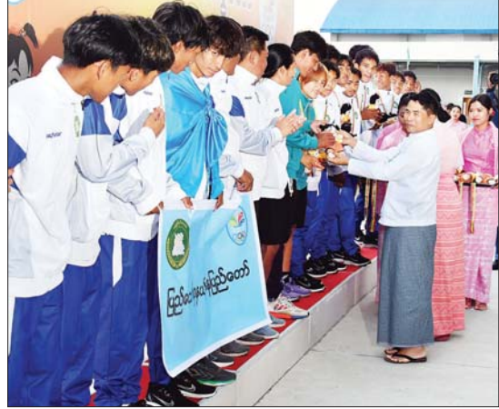
ပြည်ထောင်စုဝန်ကြီး ဦးမင်းနောင် ပြည်နယ်နှင့် တိုင်းဒေသကြီး အမျိုးသား ဘောလုံးပြိုင်ပွဲတွင် ပထမဆုရ ပြည်ထောင်စုနယ်မြေ နေပြည်တော်မှ ပြိုင်ပွဲဝင် များအား တစ်ဦးချင်းဂုဏ်ပြုဆုတံဆိပ်နှင့် အမျိုးသားအားကစားပွဲတော်အထိမ်း အမှတ်အရပ် ပေးအပ်ချီးမြှင့်စဉ်။

ရရှိကြသည့် စစ်ကိုင်းတိုင်းဒေသကြီးနှင့် မန္တလေးတိုင်းဒေသကြီး အသင်းတို့မှ ပြိုင်ပွဲဝင်များကို လည်းကောင်း၊ အမျိုး သား(-၆၀ ကီလို)တစ်ဦးချင်း ကုမိတ်ပြိုင်ပွဲ တွင် ပထမဆုရရှိသည့် ရခိုင်ပြည်နယ်၊ ဒုတိယဆုရရှိသည့် ရန်ကုန်တိုင်းဒေသကြီး၊ ပုတွဲတတိယဆုရရှိကြသည့် စစ်ကိုင်းတိုင်း ဒေသကြီးနှင့် မန္တလေးတိုင်းဒေသကြီး အသင်းတို့မှ ပြိုင်ပွဲဝင်များကိုလည်း ကောင်း၊ ဒုတိယဝန်ကြီး ဒေါက်တာအေး ထွန်းက အမျိုးသမီးတစ်ဦးချင်း ခတ်ပြိုင်ပွဲ တွင် ပထမဆုရရှိသည့် ကယားပြည်နယ်၊ ဒုတိယဆုရရှိသည့် စစ်ကိုင်းတိုင်းဒေသ ကြီး၊ ပုတွဲတတိယဆုရရှိသည့် ရန်ကုန် တိုင်းဒေသကြီးနှင့် ကချင်ပြည်နယ်အသင်း