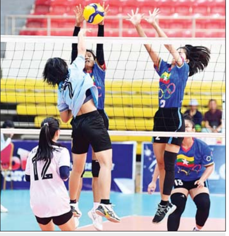
ဝန်ကြီးဌာနပေါင်းစုံ အမျိုးသမီးတော်လီဘောပြိုင်ပွဲ တတိယလှပွဲစဉ် တွင် အားကစားနှင့် လူငယ်ရေးရာဝန်ကြီးဌာနအသင်းနှင့် ပို့ဆောင် ရေးနှင့် ဆက်သွယ်ရေးဝန်ကြီးဌာနအသင်းတို့ ယှဉ်ပြိုင်ကစားစဉ်။