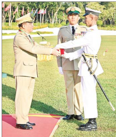
နိုင်ငံတော်စီမံအုပ်ချုပ်ရေးကောင်စီဥက္ကဋ္ဌ တပ်မတော်ကာကွယ်ရေးဦးစီးချုပ် ဗိုလ်ချုပ်မှူးကြီး သတိုးမဟာသရေစည်သူ သတိုးသိရိသုဓမ္မ မင်းအောင်လှိုင် စာပေထူးချွန်ဆုရရှိသူ ဗိုလ်လောင်း အောင်ကိုကိုထက်အား ဆုပေးအပ်ချီးမြှင့်စဉ်။