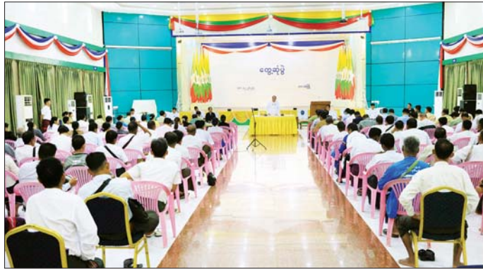
စောမြင့်ဦးသည် ဘားအံမြို့နယ်အတွင်းရှိ ရပ်ကွက်/ကျေးရွာအုပ်စု အုပ်ချုပ်ရေးမှူးများနှင့် တွေ့ဆုံသည်။ ထို့နောက် ပြည်နယ်သယံဇာတရေးရာဝန်ကြီးဦးစောဝင်းနှင့် လမ်းပန်းဆက်သွယ်ရေးဝန်ကြီး

ဘားအံ ဒီဇင်ဘာ ၁၈ ဒေသတွင်း လုံခြုံရေး၊ တရားဥပဒေစိုးမိုးရေး၊ ဒေသဖွံ့ဖြိုးရေးနှင့် ပြည်သူ့အကျိုးပြုလုပ်ငန်းများ ဆောင်ရွက်ရာတွင် ပိုမိုထိရောက်မြန်ဆန်စေရေးအတွက် ကရင်ပြည်နယ်ဝန်ကြီးချုပ်ဦးစောမြင့်ဦးသည် ယနေ့နံနက်ပိုင်းက ဘားအံမြို့၊ ဇွဲကပင်ခန်းမ၌ ဘားအံမြို့နယ်အတွင်းရှိ ရပ်ကွက်/ကျေးရွာအုပ်စု အုပ်ချုပ်ရေးမှူးများနှင့် တွေ့ဆုံသည်။ (ယာဝုံ) ဦးစောမြင့်ဦးသည် ကရင်ပြည်နယ်ဝန်ကြီးချုပ်အဖြစ် အခြေခံအကျဆုံးအဖွဲ့အစည်းဖြစ်ပြီး တာဝန်ထမ်းဆောင်နေစဉ်ကာလအတွင်း အားနည်းချက် အားသာချက်များကို ပြန်လည်သုံးသပ်၍ စိတ်စေတနာထားကာ လုပ်ငန်းတာဝန်များကို ထမ်းဆောင်ကြစေလိုကြောင်း၊ မကြာမီ တက္ကသိုလ်ဝင်စာမေးပွဲများ ပြုဆိုကြတော့မည်ဖြစ်သည့်အတွက် အောင်ချက်ကောင်းမွန်ရေးဆောင်ရွက်ရာတွင် ပိုင်းဝန်းပူးပေါင်း ဆောင်ရွက်