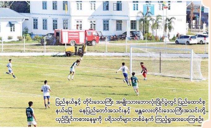
ပြည်နယ်နှင့် တိုင်းဒေသကြီး အမျိုးသားဘောလုံးပြိုင်ပွဲတွင် ပြည်ထောင်စု နယ်မြေ နေပြည်တော်အသင်းနှင့် မန္တလေးတိုင်းဒေသကြီးအသင်းတို့ ယှဉ်ပြိုင်ကစားနေမှုကို ပရိသတ်များ တစ်ခဲနက် ကြည့်ရှုအားပေးကြစဉ်။