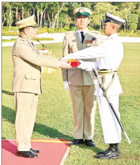
နိုင်ငံတော်စီမံအုပ်ချုပ်ရေးကောင်စီဥက္ကဋ္ဌ တပ်မတော်ကာကွယ်ရေးဦးစီးချုပ် ဗိုလ်ချုပ်မှူးကြီး သတိုးမဟာသရေစည်သူ သတိုးသိရိသုဓမ္မ မင်းအောင်လှိုင် လေ့ကျင့်ရေးထူးချွန်ဆုရရှိသူ ဗိုလ်လောင်းသော်ဇင်ဦးအား ဆုပေးအပ်ချီးမြှင့်စဉ်။