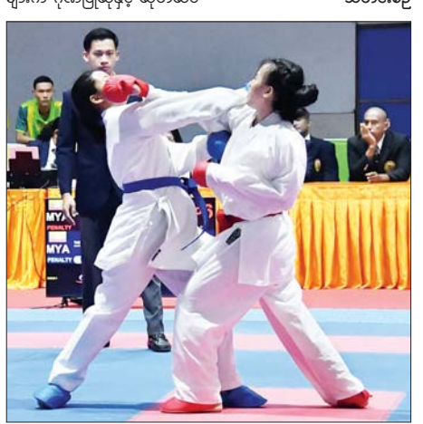
ပြည်နယ်နှင့် တိုင်းဒေသကြီး ကရတေးပြိုင်ပွဲ ဗိုလ်လှပွဲစဉ်တွင် ရှမ်းပြည်နယ်နှင့် ပြည်ထောင်စုနယ်မြေ နေပြည်တော်တို့မှ ပြိုင်ပွဲဝင် များ ယှဉ်ပြိုင်စဉ်။

တန်းအောက် တစ်ဦးချင်း “ကုမိတ်” များ ပေးဆပ်ချီးမြှင့်ကြသည်။ ပြိုင်ပွဲ၊ အမျိုးသား ၅၅ ကီလို ပြည်နယ်နှင့် တိုင်းဒေသကြီး အောက် တစ်ဦးချင်း “ကုမိတ်” ရွှေကြာပင် အောက် တစ်ဦးချင်း “ကုမိတ်” အားကစားရုံ၌ ကျင်းပရာ အမျိုး သား ဆန်းဆီ ၄၈ ကီလို၊ ၅၅ ကီလို၊ ၆၀ ကီလိုအောက် တစ်ဦးချင်း ၅၆ ကီလို၊ ၆၀ ကီလို၊ ၆၅ ကီလို၊ “ကုမိတ်” ပြိုင်ပွဲ၊ အမျိုးသား ၇၅ ကီလိုအောက် တစ်ဦးချင်း “ကုမိတ်” ၇၀ ကီလိုအောက် တစ်ဦးချင်း “ကုမိတ်” ပြိုင်ပွဲ၊ အမျိုးသမီး ဆန်းဆီ ၄၈ ကီလို၊ ၅၅ ကီလို၊ ၆၀ ကီလိုအောက် တစ်ဦးချင်း “ကုမိတ်” ပြိုင်ပွဲ၊ အမျိုးသမီး ဆန်းဆီ ၄၈ ကီလို၊ ၅၅ ကီလို၊ ၆၀ ကီလိုအောက် တစ်ဦးချင်း “ကုမိတ်” ပြိုင်ပွဲ အားကစားသမားများ ဖြစ်ပွဲဝင် အားကစားသမားများ ဝင်ရောက်ယှဉ်ပြိုင် ကစားခဲ့ကြ သည်။ ယနေ့ကျင်းပသည့် အားကစား ပြိုင်ပွဲများသို့ ပြည်ထောင်စုဆင့် ပုဂ္ဂိုလ်များ၊ ဒုတိယဝန်ကြီးများ၊ တိုင်းဒေသကြီးနှင့် ပြည်နယ် ဝန်ကြီးများ၊ ဌာနဆိုင်ရာများ၊ အားကစားနည်းအလိုက် အဖွဲ့ချုပ် များမှ တာဝန်ရှိသူများ၊ ဝန်ထမ်း များ၊ ကျောင်းသား ကျောင်းသူ များနှင့် အားကစားဝါသနာရှင် ပြည်သူများ စိတ်ပါဝင်စားစွာ လာရောက်ကြည့်ရှု အားပေးခဲ့ကြ သည်။