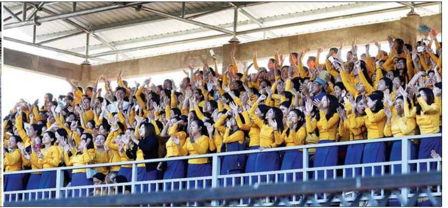
ဝန်ကြီးဌာနပေါင်းစုံ အမျိုးသားဘောလုံးပြိုင်ပွဲ ဆီမီးဖိုင်နယ်ပွဲစဉ်တွင် စီမံကိန်းနှင့် ဘဏ္ဍာရေးဝန်ကြီးဌာနအသင်းနှင့် သမဝါယမနှင့် ကျေးလက်ဖွံ့ဖြိုးရေးဝန်ကြီးဌာနအသင်းတို့ ယှဉ်ပြိုင်နေမှုကို ပရိသတ်များ တစ်ခဲနက် ကြည့်ရှုအားပေးကြစဉ်။