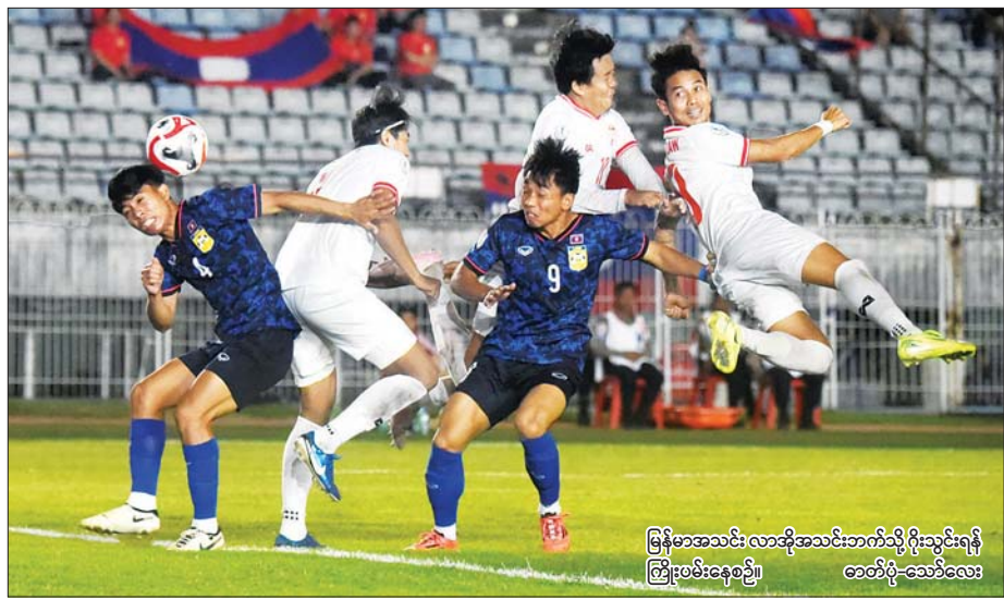
မြန်မာအသင်း လာအိုအသင်းဘက်သို့ ဂိုးသွင်းရန် ကြိုးပမ်းနေစဉ်။