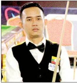
ထက်ဝေယံထွန်း(ခ)အားဖူ