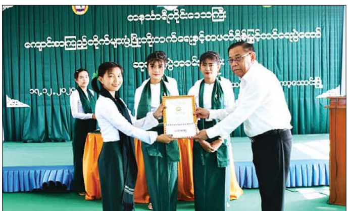
ကျားပန်းပြိုင်ပွဲ၊ ပုံပြောပြိုင်ပွဲတို့မှ ပထမဆုရရှိသော ကျောင်းသူများက ပြိုင်ပွဲဝင်ခေါင်းစဉ်များဖြင့် ပြန်လည် သရုပ်ပြပြီး ကျောင်းသား ကျောင်းသူများက အသိအမြင်တိုးစေဖို့ ပညာဘဏ်တိုက်သွားကြစို့ သိချင် ဖြင့် သိဆုံးခဲ့ကြောင်း သိရသည်။ ခရိုင်(ပြန်/ဆက်)

ရရှိအောင် လေ့ကျင့်ပေးကြရန် လိုအပ်ကြောင်း ပြောကြားသည်။ ထို့နောက် တိုင်းဒေသကြီးအစိုးရအဖွဲ့မှ ပေးအပ်သော အထက(ခွဲ)အလက (၂)ဘင်ခရေဝတ်စုံစရိတ် ငွေကျပ် ၃၅ သိန်းနှင့် လေ့ကျင့်ဝတ်စုံစရိတ် သုံးသိန်း လေးသောင်း စုစုပေါင်းငွေကျပ် ၃၈၄၀၀၀ ကို တိုင်းဒေသကြီးဝန်ကြီးချုပ်က ကျောင်းအုပ်ဆရာကြီးထံ ချီးမြှင့်ပေးအပ်သည်။ ဆက်လက်၍ တိုင်းဒေသကြီးဝန်ကြီးချုပ်၊ တိုင်းဒေသကြီးတရားလွှတ်တော်တရားသူကြီးချုပ် ဒေါ်ပိုင်ပိုင်ကလေး၊ တိုင်းဒေသကြီးဝန်ကြီးများ၊ တာဝန်ရှိသူများက ကျောင်းစာကြည့်တိုက်များ ဖွံ့ဖြိုးတိုးတက်ရေးနှင့် စာဖတ်ရိုက်မြှင့်တင်ရေးပွဲတော်၌ ကျင်းပသည့် ပြိုင်ပွဲများမှ ဆုရရှိသော ကျောင်းသား ကျောင်းသူများအား ဂုဏ်ပြုဆုနှင့် ငွေသားဆုများ ပေးအပ်ချီးမြှင့်သည်။ ယင်းနောက်ကျောင်းအကျိုးတော်ဆောင်အဖွဲ့က ကျောင်းစာကြည့်တိုက်အတွက် စာအုပ်စာစောင်များ လှူဒါန်းရာ ကျောင်းအုပ်ဆရာကြီးက လက်ခံယူပြီး