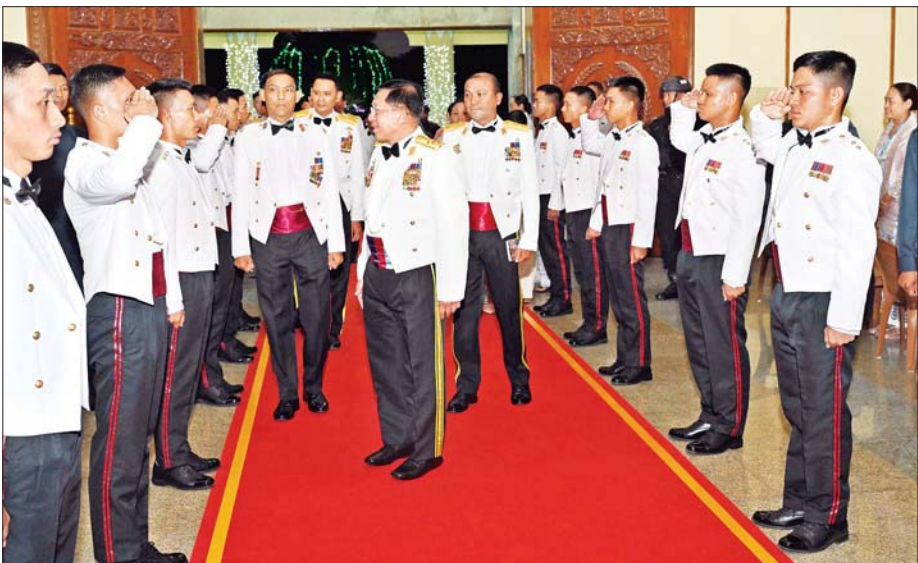
နိုင်ငံတော်စီမံအုပ်ချုပ်ရေးကောင်စီဥက္ကဋ္ဌ တပ်မတော်ကာကွယ်ရေးဦးစီးချုပ် ဗိုလ်ချုပ်မှူးကြီး မင်းအောင်လှိုင် တပ်မတော်ဆေးတက္ကသိုလ် ဗိုလ်လောင်းသင်တန်းအမှတ်စဉ်(၂၅) သင်တန်းဆင်းအရာရှိများအား တစ်ဦးချင်း ရင်းရင်းနှီးနှီး လိုက်လံနှုတ်ဆက်စဉ်။

နေပြည်တော် ဒီဇင်ဘာ ၁၈ တပ်မတော် ဆေးတက္ကသိုလ် ဗိုလ်လောင်းသင်တန်း အမှတ်စဉ် (၂၅) သင်တန်းဆင်းဂုဏ်ပြုညစာ စားပွဲအခမ်းအနားကို ယနေ့ညနေ ပိုင်းတွင် ရန်ကုန်မြို့ရှိ တပ်မတော် ဆေးတက္ကသိုလ် ဘွဲ့နှင့်သဘင် ခန်းမဆောင်ကြီး၏ စုဝေးခန်းမ၌ ကျင်းပပြုလုပ်ရာ နိုင်ငံတော်စီမံ အုပ်ချုပ်ရေး ကောင်စီဥက္ကဋ္ဌ တပ်မတော် ကာကွယ်ရေး ဦးစီးချုပ် ဗိုလ်ချုပ်မှူးကြီး မင်းအောင်လှိုင် တက်ရောက် ချီးမြှင့်သည်။