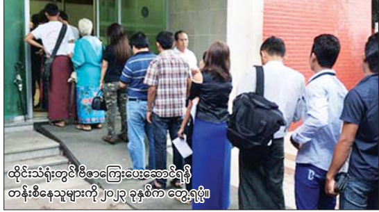
ထိုင်းသံရုံးတွင် ပီဗီအေအိုင်အေကြီးကြပ်ရေးမှူးများနှင့် ပူးပေါင်းဆောင်ရွက်ရန် အတွက် ကရင်ပြည်နယ်ဝန်ကြီးချုပ် ဦးစောမြင့်ဦး တွေ့ဆုံသည်။

ရန်ကုန် ဒီဇင်ဘာ ၁၈ ပီဗီအေအိုင်အေပေးသွင်းရာတွင် ထိုင်းသံရုံးရှိ ပီဗီအေအိုင်အေ ကြီးကြပ်ရေးမှူးများနှင့် ပူးပေါင်းဆောင်ရွက်ရန် အတွက် ကရင်ပြည်နယ်ဝန်ကြီးချုပ် ဦးစောမြင့်ဦးသည် ထိုင်းသံရုံးရှိ ပီဗီအေအိုင်အေ ကြီးကြပ်ရေးမှူးများနှင့် တွေ့ဆုံသည်။ ထိုင်းသံရုံးရှိ ပီဗီအေအိုင်အေ ကြီးကြပ်ရေးမှူးများက ကရင်ပြည်နယ်အတွင်းရှိ ပီဗီအေအိုင်အေ ပေးသွင်းရာတွင် ထိုင်းသံရုံးရှိ ပီဗီအေအိုင်အေ ကြီးကြပ်ရေးမှူးများနှင့် ပူးပေါင်းဆောင်ရွက်ရန် အတွက် ကရင်ပြည်နယ်ဝန်ကြီးချုပ် ဦးစောမြင့်ဦး တွေ့ဆုံသည်။