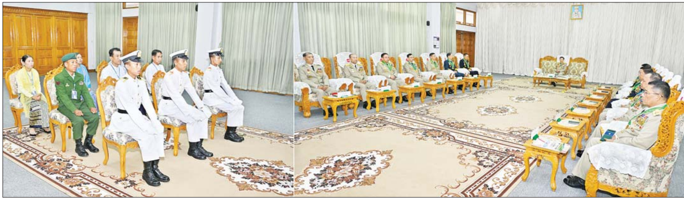
နိုင်ငံတော်စီမံအုပ်ချုပ်ရေးကောင်စီဥက္ကဋ္ဌ တပ်မတော်ကာကွယ်ရေးဦးစီးချုပ် ဗိုလ်ချုပ်မှူးကြီး သတိုးမဟာသရေစည်သူ သတိုးသိရီသုဓမ္မ မင်းအောင်လှိုင် ထူးချွန်ဆုရရှိကြသည့် ဗိုလ်လောင်းများနှင့် မိဘများကို တွေ့ဆုံ၍ ဂုဏ်ပြုအမှာစကားပြောကြားစဉ်။

( ၃-၉-၂၀၂၄ ရက်နေ့တွင် နိုင်ငံတော်စီမံအုပ်ချုပ်ရေးကောင်စီဥက္ကဋ္ဌ နိုင်ငံတော်ဝန်ကြီးချုပ် ဗိုလ်ချုပ်မှူးကြီး မင်းအောင်လှိုင် ရှမ်းပြည်နယ်အစိုးရအဖွဲ့ဝင်များ၊ ပြည်နယ်နှင့် ခရိုင်အဆင့်ဌာနဆိုင်ရာတာဝန်ရှိသူများအား ပြောကြားသည့် အမှာစကားမှ ကောက်နုတ်ချက် )