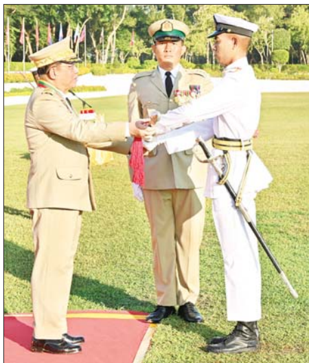
နိုင်ငံတော်စီမံအုပ်ချုပ်ရေးကောင်စီဥက္ကဋ္ဌ တပ်မတော်ကာကွယ်ရေးဦးစီးချုပ် ဗိုလ်ချုပ်မှူးကြီး သတိုးမဟာသရေစည်သူ သတိုးသိရိသုဓမ္မ မင်းအောင်လှိုင် အောင်စစ်သည်ဆုရရှိသူ ဗိုလ်လောင်းကောင်းမြင့်မြတ်ထွန်းအား ဆုပေးအပ်ချီးမြှင့်စဉ်။