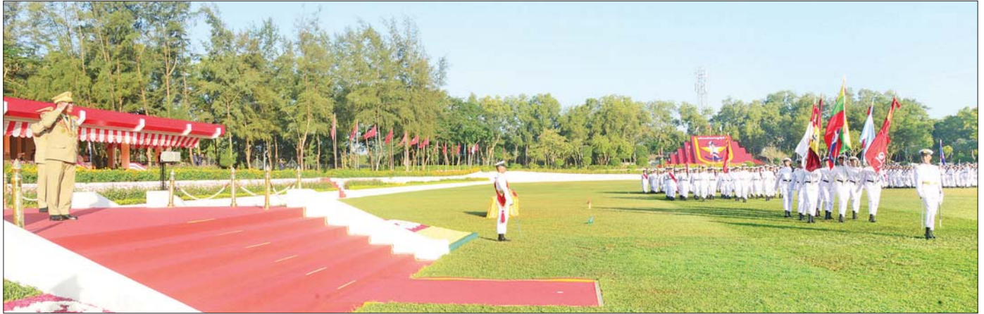
နိုင်ငံတော်စီမံအုပ်ချုပ်ရေးကောင်စီဥက္ကဋ္ဌ တပ်မတော်ကာကွယ်ရေးဦးစီးချုပ် ဗိုလ်ချုပ်မှူးကြီး သတိုးမဟာသရေစည်သူ သတိုးသိရိသုဓမ္မ မင်းအောင်လှိုင် အား ဗိုလ်လောင်းတပ်ခွဲများက အနွေးလျှောက်၊ အမြန်လျှောက်ဖြင့် ချီတက်အလေးပြုကြစဉ်။