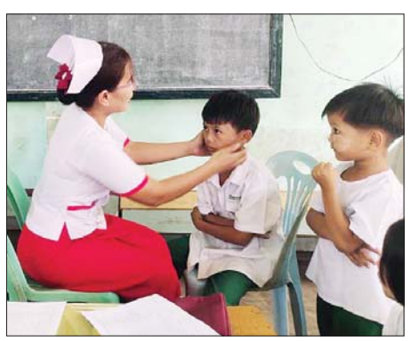
ကျောင်းအခြေပြု တီဘီရောဂါရှာဖွေခြင်း ဆောင်ရွက်သလို ဒီဇင်ဘာ ၁၈

ရန်ကုန် ဒီဇင်ဘာ ၁၈ ရန်ကုန်တိုင်းဒေသကြီး မိခင်နှင့် ကလေးစောင့်ရှောက်မှု ကြီးကြပ်ရေးအဖွဲ့နှင့် ရန်ကုန်တိုင်းဒေသကြီး ကုသရေးနှင့် ပြည်သူ့ကျန်းမာရေးဦးစီးဌာနတို့ ပူးပေါင်းဆောင်ရွက်သည့် မရှိမလင်းသူ မရှိစေရ အစီအစဉ်ဖြင့် ဒဂုံမြို့သစ်ခရိုင်အတွင်းရှိ မျက်စိလူနာများအား မျက်စိစမ်းသပ်ကုသပေးခြင်းနှင့် ရန်ကုန်အရှေ့ပိုင်း ပြည်သူ့ဆေးရုံကြီးမှ အထူးကု ဆရာဝန်ကြီးများက ဒဂုံမြို့သစ် (တောင်ပိုင်း)မြို့နယ် အတွင်းရှိ