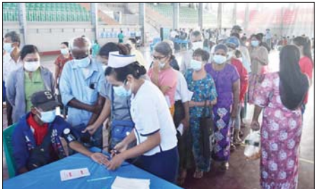
လူနာများအား နယ်လှည့် ကုသပေးသည်။ ထိုသို့ စမ်းသပ်ကုသပေးရာ နေရာသို့ ရန်ကုန်တိုင်းဒေသကြီး ကုသရေးနှင့် ပြည်သူ့ကျန်းမာရေးဦးစီးဌာနမှူး ဒုတိယညွှန်ကြားရေးမှူးချုပ် ဒေါက်တာနန္ဒဝင်း၊ ဒဂုံမြို့သစ်ခရိုင် စီမံအုပ်ချုပ်ရေးအဖွဲ့ဥက္ကဋ္ဌ ဦးအောင်ကိုနှင့် အဖွဲ့ဝင်များ၊ ရန်ကုန်အရှေ့ပိုင်းပြည်သူ့ဆေးရုံကြီးမှ ဆေးရုံအုပ်ကြီး ဒေါက်တာသူရနှင့် ကျန်းမာရေးဝန်ထမ်းများက အားပေးကြည့်ရှုကာ မြို့နယ်ရဲတပ်ဖွဲ့ဝင်များ၊ မီးသတ်တပ်ဖွဲ့ဝင်များ၊ မြို့နယ်ကုသရေးနှင့်ပြည်သူ့ကျန်းမာရေးဦးစီးဌာနဝန်ထမ်းများ၊ ကြက်ခြေနီတပ်ဖွဲ့ဝင်များ၊ ပရဟိတအဖွဲ့များက လိုအပ်သည်များ ကူညီဆောင်ရွက်ပေးခဲ့ကြကြောင်း သိရသည်။ နေမျိုးအောင်

ရန်ကုန် ဒီဇင်ဘာ ၁၈ ရန်ကုန်တိုင်းဒေသကြီး မိခင်နှင့် ကလေးစောင့်ရှောက်မှု ကြီးကြပ်ရေးအဖွဲ့နှင့် ရန်ကုန်တိုင်းဒေသကြီး ကုသရေးနှင့် ပြည်သူ့ကျန်းမာရေးဦးစီးဌာနတို့ ပူးပေါင်းဆောင်ရွက်သည့် မရှိမလင်းသူ မရှိစေရ အစီအစဉ်ဖြင့် ဒဂုံမြို့သစ်ခရိုင်အတွင်းရှိ မျက်စိလူနာများအား မျက်စိစမ်းသပ်ကုသပေးခြင်းနှင့် ရန်ကုန်အရှေ့ပိုင်း ပြည်သူ့ဆေးရုံကြီးမှ အထူးကု ဆရာဝန်ကြီးများက ဒဂုံမြို့သစ် (တောင်ပိုင်း)မြို့နယ် အတွင်းရှိ