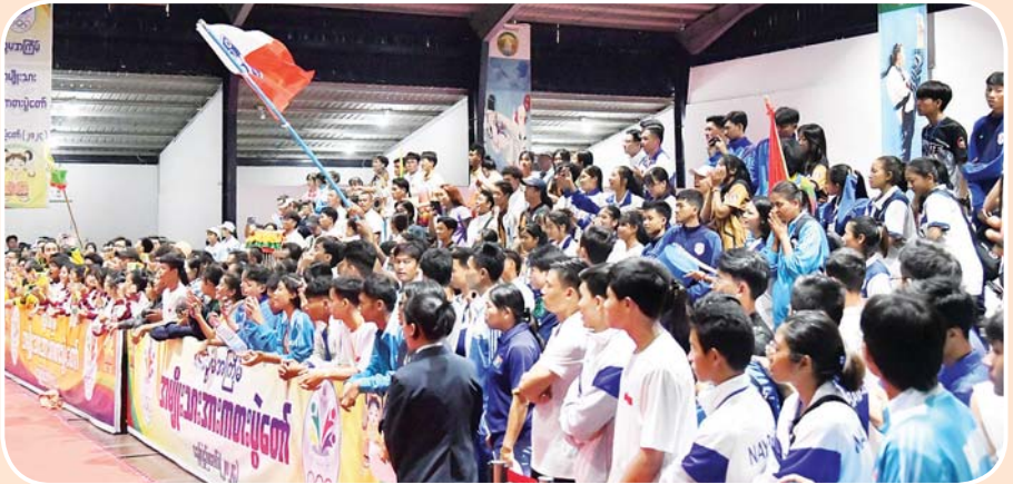
ပြည်နယ်နှင့် တိုင်းဒေသကြီး ကရာတေးပြိုင်ပွဲ ဗိုလ်လုပွဲစဉ်တွင် ကချင်ပြည်နယ်နှင့် ရန်ကုန်တိုင်းဒေသကြီးတို့မှ ပြိုင်ပွဲဝင်များ ယှဉ်ပြိုင်နေမှုကို ပရိသတ်များ တစ်ခဲနက် ကြည့်ရှုအားပေးကြစဉ်။