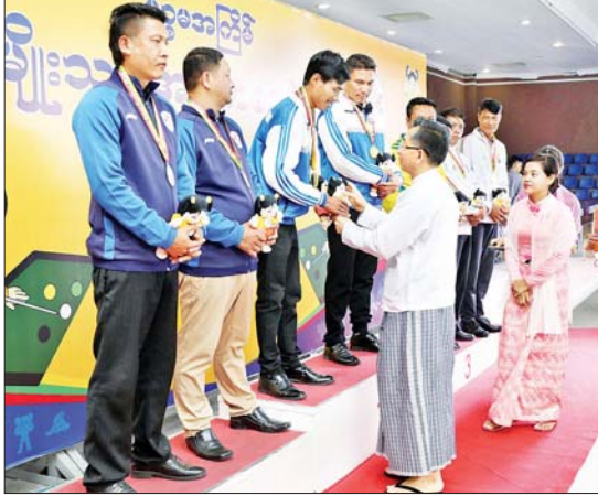
ပြည်ထောင်စုဝန်ကြီး ဦးကိုကိုလှိုင် ပြည်နယ်နှင့် တိုင်းဒေသကြီး ဘီလီယံနိုက်စ်နှင့် ဘီလီယံနိုက်စ် ပြိုင်ပွဲတွင် ပထမဆုရ ဧရာဝတီတိုင်းဒေသကြီးမှ ပြိုင်ပွဲဝင်များအား တစ်ဦးချင်း ဂုဏ်ပြုဆုတံဆိပ်နှင့် အမျိုးသားအားကစားပွဲတော် အထိမ်းအမှတ်အရပ် ပေးအပ်ချီးမြှင့်စဉ်။

ထို့နောက် ကယားပြည်နယ်အစိုးရ အဖွဲ့ လူမှုရေးရာဝန်ကြီးဦးအောင်ချီးသိမ်း က အမျိုးသမီး (-၅၀ ကီလို) တစ်ဦးချင်း ကုမိတ်ပြိုင်ပွဲတွင် ပထမဆုရရှိသည့် ကချင်ပြည်နယ်၊ ဒုတိယဆုရရှိသည့် ရန်ကုန်တိုင်းဒေသကြီး၊ ပုတွဲတတိယဆု ရန်ကုန်တိုင်းဒေသကြီး၊ ပုတွဲတတိယဆု