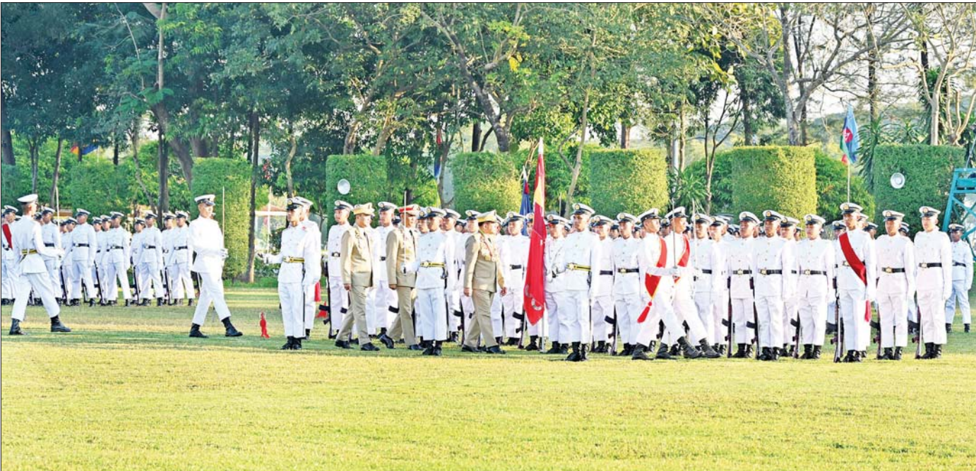
နိုင်ငံတော်စီမံအုပ်ချုပ်ရေးကောင်စီဥက္ကဋ္ဌ တပ်မတော်ကာကွယ်ရေးဦးစီးချုပ် ဗိုလ်ချုပ်မှူးကြီး သတိုးမဟာသရေစည်သူ သတိုးသီရိသုဓမ္မ မင်းအောင်လှိုင် ကျောင်းဆင်းဗိုလ်လောင်းတပ်ခွဲအား စစ်ဆေးစဉ်။

နိုင်ငံတော်စီမံအုပ်ချုပ်ရေးကောင်စီဥက္ကဋ္ဌ တပ်မတော်ကာကွယ်ရေးဦးစီးချုပ် ဗိုလ်ချုပ်မှူးကြီး သတိုးမဟာသရေစည်သူ သတိုးသီရိသုဓမ္မ မင်းအောင်လှိုင် တပ်မတော်ဆေးတက္ကသိုလ် ဗိုလ်လောင်းသင်တန်းအမှတ်စဉ်(၂၅) သင်တန်းဆင်း ဂုဏ်ပြုစစ်ရေးပြအခမ်းအနားသို့ တက်ရောက်မိန့်ခွန်းပြောကြား ဆေးဝန်ထမ်းတပ်ဖွဲ့၏ မူလတာဝန်များအပြင် နိုင်ငံတော်၏ ကျန်းမာရေးကဏ္ဍမြှင့်တင်ရေးလုပ်ငန်းစဉ်များကို အထောက်အကူပြုပေးနိုင်သည့် တပ်မတော်သားဆရာဝန်သမားကောင်းများအဖြစ် တာဝန်ထမ်းဆောင်