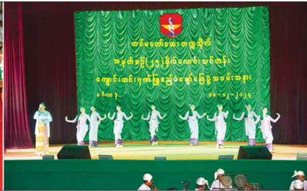
နိုင်ငံတော်စီမံအုပ်ချုပ်ရေးကောင်စီဥက္ကဋ္ဌ တပ်မတော်ကာကွယ်ရေးဦးစီးချုပ် ဗိုလ်ချုပ်မှူးကြီး မင်းအောင်လှိုင်၊ ဇနီး ဒေါ်ကြူကြူလှနှင့်အဖွဲ့ဝင်များ မြဝတီတေးဂီတအဖွဲ့၏ တေးသီချင်းများဖြင့် ဂုဏ်ပြုဖျော်ဖြေ တင်ဆက်မှုကို ကြည့်ရှုအားပေးစဉ်။