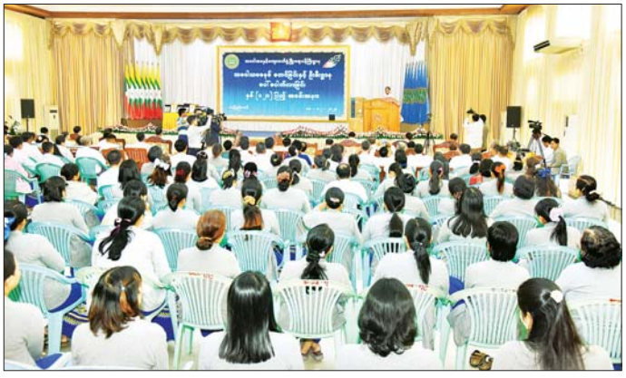
ဆက်လက်၍ ပြည်ထောင်စု ဝန်ကြီး၊ ဒုတိယဝန်ကြီး၊ အမြဲတမ်း အတွင်းဝန်နှင့် တာဝန်ရှိသူများ က ဦးစီးဌာနမှ ဂုဏ်ထူးဆောင်ဆု ရရှိသူများ၊ ဆုရရှိသော ဝန်ထမ်း များနှင့် အသင်းများ၊ ထူးချွန် ကျောင်းသူအား ဆုဖွဲ့ပေးအပ် ပြီး မှတ်တမ်းတင်ဓာတ်ပုံရိုက်ကြ ကြောင်း သိရသည်။ သတင်းစဉ်

နေပြည်တော် ဒီဇင်ဘာ ၁၈ သမဝါယမစနစ်စတင်ခြင်းနှင့် ဦးစီးဌာနပေါ်ပေါက်လာခြင်း နှစ် (၁၂၀) ပြည့် နှစ်ပတ်လည်နေ့ အခမ်းအနားကို ယနေ့နံနက်ပိုင်းတွင် သမဝါယမနှင့် ကျေးလက်ဖွံ့ဖြိုးရေးဝန်ကြီးဌာန၌ ကျင်းပသည်။ (ယာဝု) အခမ်းအနားသို့ သမဝါယမ ဖွဲ့စည်းတာဝန်ပေးအပ်ခြင်း ခံခဲ့ ထို့နောက် ပြည်ထောင်စု နှင့် ကျေးလက်ဖွံ့ဖြိုးရေးဝန်ကြီး ရပြီး သမဝါယမလုပ်ငန်းများ ဝန်ကြီးက အဆက်ဆက်တာဝန် ဌာန ပြည်ထောင်စုဝန်ကြီး ရေရှည်တည်တံ့ ခိုင်မြဲအောင် ထမ်းဆောင်ခဲ့ကြသော ဂုဏ်ပြုခံ ဦးလှစိုး၊ ဒုတိယဝန်ကြီး ဦးမြင့်စိုး၊ အမြဲတမ်းအတွင်းဝန်၊ အငြိမ်းစား အငြိမ်းစားဝန်ကြီး၊ ဒုတိယဝန်ကြီး ဂုဏ်ပြုခံပုဂ္ဂိုလ်များနှင့် တာဝန်ရှိ လယ်သမား၊ ထုတ်ကုန်များ ဦးသန်းထွန်း (ငြိမ်း) အား အမှတ် သူများ တက်ရောက်ကြသည်။ ကိုဈေးကွက်သို့ ချိတ်ဆက်ပေးနိုင် တရ လက်ဆောင်ပစ္စည်းများ ပေးအပ်သည်။ အခမ်းအနားတွင် ပြည် ထောင်စုဝန်ကြီး ဦးလှစိုးက ၁၉၀၄ ခုနှစ် ဒီဇင်ဘာမှ စတင်ပေါ်ပေါက် ခဲ့သည့် သမဝါယမဌာန/သမဝါယမ ညွှန်ကြားရေးဌာန/ သမဝါယမ ဦးစီးဌာနဟူသော အမည်နာမ များဖြင့် ခေတ်အဆက်ဆက်အစိုးရ ဆောင်ရွက်သွားကြရမည် ဖြစ်ပါ ဝန်ကြီးဌာနများ၏ အောက်တွင် ကြောင်း ပြောကြားသည်။