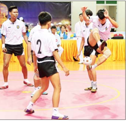
ပြည်နယ်နှင့် တိုင်းဒေသကြီး ရိုးရာခြင်းလုံးဝတ်ပြိုင်ပွဲ ဗိုလ်လှပွဲတွင် မန္တလေးတိုင်းဒေသကြီးမှ ပြိုင်ပွဲဝင်များ ယှဉ်ပြိုင်ကစားနေမှုကို တွေ့ရစဉ်။

ဆီမီးဖိုင်နယ် ပွဲစဉ်များကို ပေါင်းလောင်းအားကစားကွင်းနှင့် ဝဏ္ဏသိဒ္ဓိအားကစားကွင်း၊ လေ့ကျင့် ရေးကွင်း(၃)၌ ယှဉ်ပြိုင်ကစား ကြရာ ဆောက်လုပ်ရေးဝန်ကြီး ဌာနအသင်းက အားကစားနှင့် လူငယ်ရေးရာဝန်ကြီးဌာနအသင်း ကို သုံးရိုး-ရိုးမရှိ၊ စီမံကိန်းနှင့် ဘဏ္ဍာရေးဝန်ကြီးဌာနအသင်းက သမဝါယမနှင့် ကျေးလက်ဖွံ့ဖြိုး ရေးဝန်ကြီးဌာနအသင်းကို နှစ်ရိုး- ရိုးမရှိဖြင့် အနိုင်ရရှိခဲ့ကြသည်။