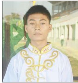
မောင်ဟိန်းထက်မင်း