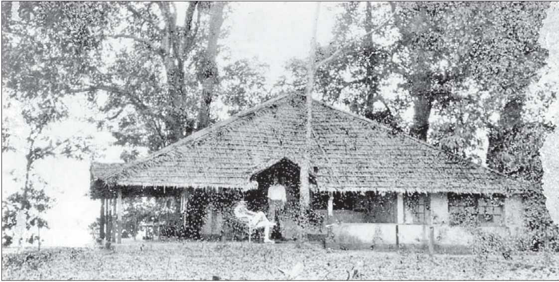
ရန်ကုန်ရွက်လှေအသင်း၏ ပထမဆုံး Club House အဆောက်အအုံ (၁၉၂၅ ခုနှစ်)။

သို့ဖြစ်ရာ မြန်မာနိုင်ငံ ရွက်လှေ အဖွဲ့ချုပ်က ရန်ကုန်ရွက်လှေအသင်း၏ ရာပြည့်အထိမ်းအမှတ် အကြိုရွက်လှေ ပြိုင်ပွဲများကို Class အလိုက်၊ Series အလိုက် ရန်ကုန်မြို့ရှိ အင်းယားကန်နှင့် ဧရာဝတီတိုင်းဒေသကြီး ငွေဆောင် တို့တွင် တစ်နှစ်ပတ်လုံး အချိန်ယူ ကျင်းပပေးနေခြင်းဖြစ်ပြီး ပြိုင်ပွဲဝင်