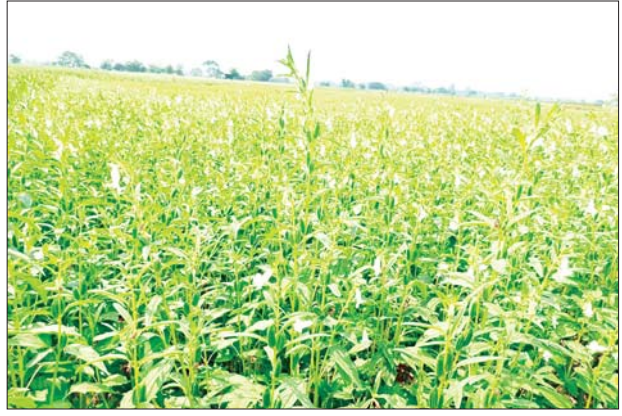
ပိုင်နိုင်စွာ ဆောင်ရွက်လုပ်ကိုင် ဖောင်ကြီးတင်စနစ်တို့ဖြင့် မိမိ လျက်ရှိပြီး ခုတ်ဖုံးစနစ်၊ ရေမြေဒေသအပေါ် မူတည်၍ ထွန်ကြောင်းပေး မျိုးစေ့ချစနစ်၊ စိုက်ပျိုးကြသည်။

ဝက်လက် မေ ၁၅ ရွှေဘိုခရိုင် ဝက်လက်မြို့နယ် တွင် သဖန်းဆိပ်ဆည်ရေဖြင့် နွေနှမ်းကို ဧက ၅၅၀၀၀ လျာထား ရာ ယနေ့အချိန်အထိ ၆၆၀၆၇ ဧက စိုက်ပျိုးနိုင်ခဲ့သဖြင့် လျာထား ဧကထက် ၁၀၀၆၇ ဧက ပိုမို စိုက်ပျိုးနိုင်ခဲ့သည်။ ဝက်လက်မြို့နယ်မှ နွေနှမ်းစိုက် တောင်သူများသည် နှစ်စဉ်နွေနှမ်း အဆက်မပြတ်စိုက်ပျိုး ထုတ်လုပ် လျက်ရှိရာ နွေနှမ်းကို အရည် အသွေးကောင်း၊ အထွက်နှုန်း ကောင်းရရှိအောင် ကျွမ်းကျင်