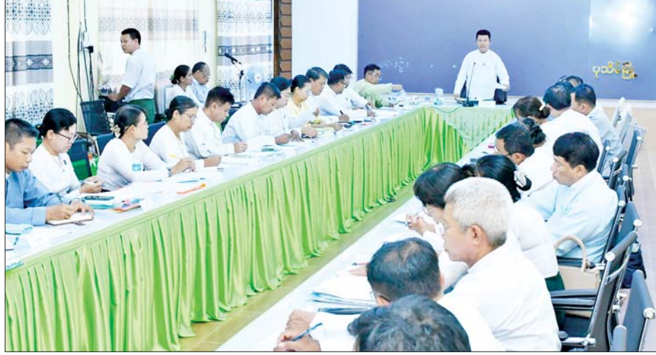
ဘာသာရပ်များ ကျွမ်းကျင်ပိုင်နိုင်ရေး၊ ကျောင်းအဆောက်အအုံများ ဥပမိရုပ်ကောင်းမွန်ရေးကိစ္စများကို ရှင်းလင်းဆွေးနွေးတင်ပြမှုများအပေါ် တိုင်းဒေသကြီးဝန်ကြီးချုပ်က လိုအပ်သည်များကို

ပုသိမ် မေ ၁၅ ဧရာဝတီတိုင်းဒေသကြီးအတွင်းရှိ ကျောင်းနေအရွယ်ကလေးအားလုံး ကျောင်းအပ်နှံရေး၊ အခြေခံပညာကျောင်းများ အဆင်သင့်ဖြစ်စေရေး လုပ်ငန်းညှိနှိုင်းအစည်းအဝေးကို ယနေ့နံနက်ပိုင်းက တိုင်းဒေသကြီး ပညာရေးမှူးရုံး အစည်းအဝေးခန်းမ (၁) ၌ ပြုလုပ်သည်။ ဦးစွာ တိုင်းဒေသကြီးဝန်ကြီးချုပ်က အမှာစကားပြောကြားသည်။ ထို့နောက် တိုင်းဒေသကြီးပညာရေးမှူးက ၂၀၂၄-၂၀၂၅ ပညာသင်နှစ်တွင် ဆောင်ရွက်မည့် ပညာရေးဆိုင်ရာ ကိစ္စရပ်များအားလည်းကောင်း၊ တိုင်းဒေသကြီးအတွင်းရှိ ခရိုင်ရပ်ကွက်မှ ခရိုင်ပညာရေးမှူးများနှင့် မြို့နယ်ပညာရေးမှူးများက ပညာရေးဆိုင်ရာလုပ်ငန်းများ ဆောင်ရွက်ထားရှိမှုအားလည်းကောင်း၊ တိုင်းဒေသကြီး လူမှုရေးရာဝန်ကြီးက ဆရာဆရာမများ၏ ဝတ်စားဆင်ယင်မှု မိမိသင်ကြားသည့်