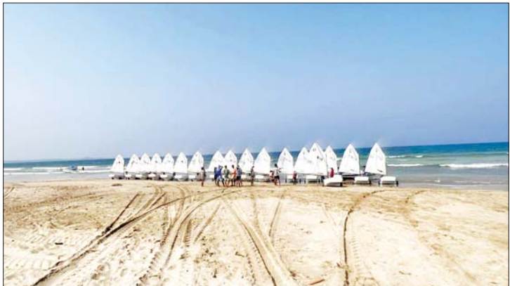
ငွေဆောင်တွင် Optimist လှေများ Launch ပြုလုပ်ရန်စီတန်းထားစဉ်။

ရာပြည့်ကာလသို့ ရောက်ရှိလာပြီ ဖြစ်သည့် မြန်မာ့ရွက်လှေအားကစား ရေရှည်တည်တံ့ရေး၊ အားကစားမျိုး ဆက်သစ်များ ပေါ်ထွက်လာရေး၊ အခြေခံလိုအပ်သော ရွက်လှေအသင်း များ ပေါ်ထွက်လာရေးတို့အတွက် နိုင်ငံတော်အစိုးရ၊ မြန်မာနိုင်ငံရွက်လှေ အဖွဲ့ချုပ်၊ တိုင်းဒေသကြီးနှင့် ပြည်နယ် များမှ တာဝန်ရှိသူများ၊ အသိပညာရှင် များ၊ စီးပွားရေးလုပ်ငန်းရှင်များ ပူးပေါင်း ပါဝင်ဆောင်ရွက်ခြင်းဖြင့် မြန်မာ့ရွက်လှေ အားကစားသည် အရှေ့တောင်အာရှ ပြိုင်ပွဲများမှသည် ကမ္ဘာ့အဆင့်ပြိုင်ပွဲ များဆီသို့ တက်လှမ်းနိုင်မည်ဟု ထင်မြင် မိပါကြောင်း ရန်ကုန်ရွက်လှေအသင်း နှစ် (၁၀၀) ပြည့်ကို ကြိုဆိုဂုဏ်ပြု ရေးသားလိုက်ရပါသည်။ ။