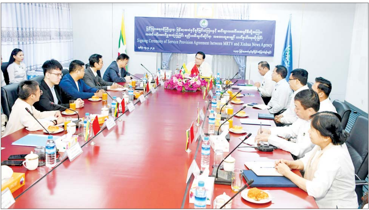
မြန်မာ့အသံနှင့် ရုပ်မြင်သံကြားနှင့် ဆင်ဟွာသတင်းအေဂျင်စီတို့ လုပ်ငန်းသဘောတူညီချက် Service Provision Agreement သတင်းဝန်ဆောင်မှု အသုံးပြုခြင်း စည်းကမ်းချက်ဆိုင်ရာ သဘောတူစာချုပ် လက်မှတ်ရေးထိုးခြင်း အခမ်းအနား ကျင်းပစဉ်။