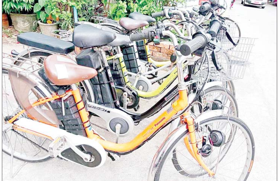
ဘက်ထရီစက်ဘီးအရောင်းဆိုင်၌ ရောင်းရန်ပြသထားသော စက်ဘီးများကို တွေ့ရစဉ်။

ထိုသို့ကွင်းဆင်းကြည့်ရှုစဉ် အသင်းအမှုဆောင်များနှင့်တွေ့ဆုံ၍ နွေစပါးစိုက်ပျိုးထားရှိမှုအပေါ် သွင်းအားစုနှင့် ပံ့ပိုးငွေများအား သမဝါယမအသင်းအချင်းချင်း ချိတ်ဆက်ရယူ၍ လုပ်ငန်းများဆောင်ရွက် နိုင်ရေး၊ သီးနှံများ အထွက်တိုးအောင်မြင်စေရေးနှင့် အသင်းသားများ ၏အကျိုးအမြတ်များရရှိစေရေးကို အလေးထားဆောင်ရွက်သွားရန် မှာကြားသည်။ အဆိုပါ ချယ်ရီမြေ စိုက်ပျိုးရေးနှင့်အထွေထွေစီးပွား ရေးလုပ်ငန်း သမဝါယမအသင်းမှ အသင်းသား ၃၃ ဦးပိုင် လယ်မြေဧက ၄၀၀ တွင် နွေစပါးစိုက်ပျိုးဖြစ်ထွန်းလျက်ရှိကြောင်း သိရသည်။ သတင်းစဉ်