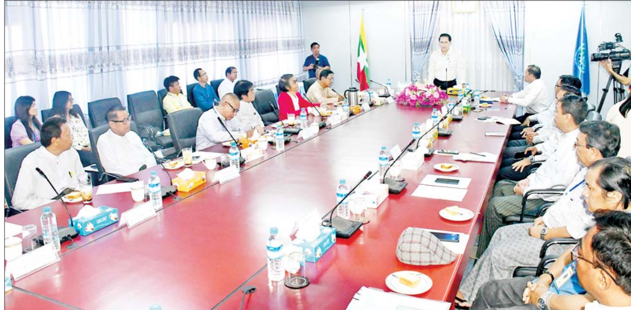
ပြည်ထောင်စုဝန်ကြီး ဦးမောင်မောင်အုန်း ဂီတအကယ်ဒမီဆုပေးပွဲ ပြုလုပ်နိုင်ရန်အတွက် ဂီတအနုပညာရှင်များနှင့် တွေ့ဆုံဆွေးနွေး ပွဲတွင် အမှာစကား ပြောကြားစဉ်။

နှစ်ဘာသာဖြင့် လက်မှတ် ရေးထိုးကြသည်။ ထို့နောက်ပြည်ထောင်စုဝန်ကြီး ဦးမောင်မောင်အုန်းက ဆင်ဟွာ သတင်းအေဂျင်စီ၊ အာရှ-ပစိဖိတ် ဒေသဆိုင်ရာဗဟိုရုံး ဒုတိယ ညွှန်ကြားရေးမှူးချုပ်နှင့် အဖွဲ့အား အမှတ်တရ လက်ဆောင်ပစ္စည်း များ ပေးအပ်ရာ ဆင်ဟွာသတင်း အေဂျင်စီအဖွဲ့ကလည်း အမှတ်တရ လက်ဆောင် ပြန်လည်ပေးအပ်ပြီး စုပေါင်းမှတ်တမ်းတင် ဓာတ်ပုံ ရိုက်ကြသည်။ ဆင်ဟွာသတင်းဌာန (XINHUA NEWS AGENCY)ကို ၁၉၃၁ ခုနှစ်