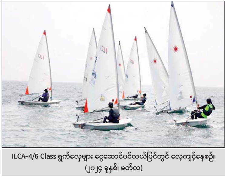
ILCA-4/6 Class ရွက်လှေများ ငွေဆောင်ပင်လယ်ပြင်တွင် လေ့ကျင့်နေစဉ်။ (၂၀၂၄ ခုနှစ်၊ မတ်လ)

မြန်မာနိုင်ငံ ရွက်လှေအဖွဲ့ချုပ်အနေ ဖြင့် ရန်ကုန်ရွက်လှေအသင်းနှင့်အတူ ရှင်သန်ပေါက်ဖွားလာသည့် မြန်မာ့ ရွက်လှေအားကစား နှစ် (၁၀၀) ပြည့်အခမ်း အနားကို ကြီးကျယ်ခမ်းနားစွာ ကျင်းပ နိုင်ရေး ပြင်ဆင်နေသလို တစ်ဖက်တွင် လည်း ၂၀၂၅ ခုနှစ် ထိုင်းနိုင်ငံတွင် ကျင်းပ မည့် 33 rd SEA Games ပြိုင်ပွဲတွင်လည်း ကမ္ဘာ့အဆင့်ဝင် ပြိုင်ဘက်နိုင်ငံများကို အန်တုယှဉ်ပြိုင်အနိုင်ရရှိရေး အားသွန် ကြိုးပမ်း ပြင်ဆင်ဆောင်ရွက်လျက်ရှိ သည်။