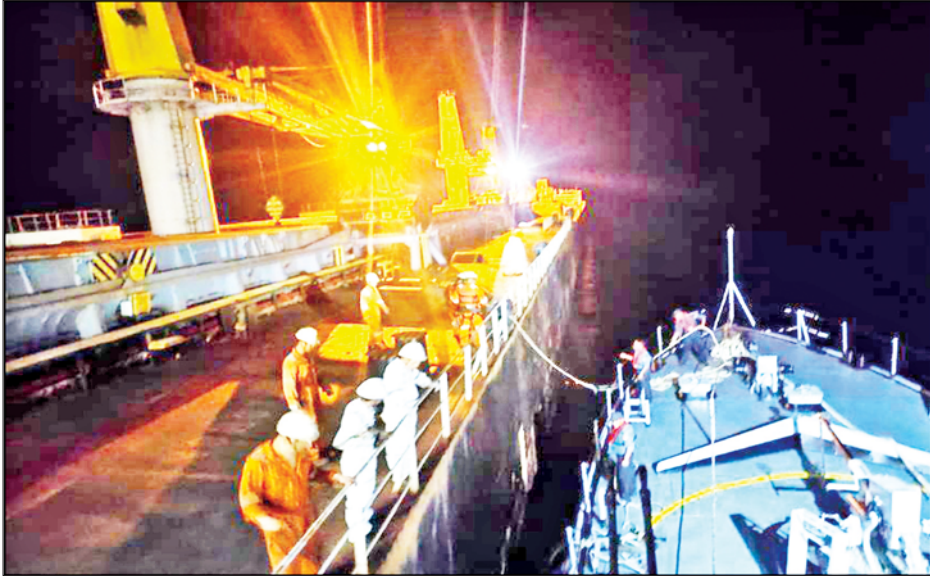
တပ်မတော်(ရေ)၏ အမြန်သွားတိုက်ခိုက်ရေးရေယာဉ်မှ လုံခြုံရေးတပ်ဖွဲ့ဝင်များ တရုတ်နိုင်ငံပိုင် CHANG HANG HAO HAI အမည်ရှိ ကုန်တင်ရေယာဉ်ကြီးပေါ်ရှိ ဒဏ်ရာရလူနာအား ကူညီကယ်ဆယ်ရေး ဆောင်ရွက်ပေးစဉ်။