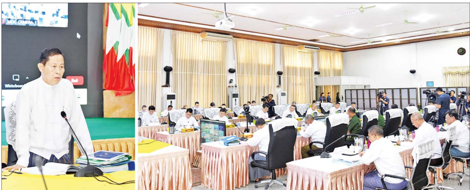
နိုင်ငံတော်စီမံအုပ်ချုပ်ရေးကောင်စီ ဒုတိယဥက္ကဋ္ဌ ဒုတိယဝန်ကြီးချုပ် ဒုတိယဗိုလ်ချုပ်မှူးကြီးစိုးဝင်း တရားမဝင်ကုန်သွယ်မှုတိုက်ဖျက်ရေး ဦးဆောင်ကော်မတီ လုပ်ငန်း ညှိနှိုင်းအစည်းအဝေး(၂/၂၀၂၄)တွင် အမှာစကားပြောကြားစဉ်။

နေပြည်တော် မေ ၁၅ တရားမဝင် ကုန်သွယ်မှု တိုက်ဖျက်ရေး ဦးဆောင် ကော်မတီ လုပ်ငန်းညှိနှိုင်းအစည်း အဝေး(၂/၂၀၂၄)ကို ယနေ့မွန်းလွဲ ပိုင်းတွင် နေပြည်တော်ရှိ စီးပွား ရေးနှင့် ကူးသန်းရောင်းဝယ်ရေး ဝန်ကြီးဌာန ညီလာခံခန်းမ၌ ကျင်းပရာ တရားမဝင်ကုန်သွယ်မှု တိုက်ဖျက်ရေး ဦးဆောင် ကော်မတီဥက္ကဋ္ဌ နိုင်ငံတော်စီမံ အုပ်ချုပ်ရေးကောင်စီ ဒုတိယ ဥက္ကဋ္ဌ ဒုတိယဝန်ကြီးချုပ် ဒုတိယဗိုလ်ချုပ်မှူးကြီး စိုးဝင်း တက်ရောက် အမှာစကား ပြောကြားသည်။ စာမျက်နှာ ၄ ကော်လံ ၁ သို့ ။