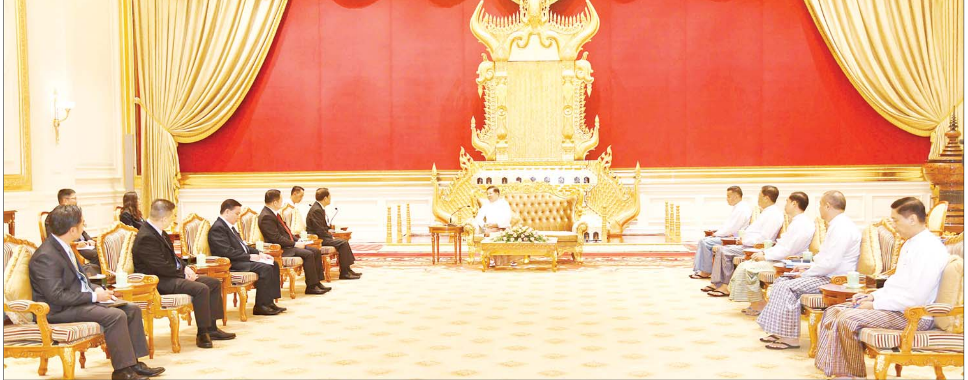
နိုင်ငံတော်စီမံအုပ်ချုပ်ရေးကောင်စီဥက္ကဋ္ဌ နိုင်ငံတော်ဝန်ကြီးချုပ် ဗိုလ်ချုပ်မှူးကြီးမင်းအောင်လှိုင် အာဆီယံအလှည့်ကျဥက္ကဋ္ဌ၏ မြန်မာနိုင်ငံဆိုင်ရာအထူးကိုယ်စားလှယ် H.E. Mr. Alounkeo KITTIKHOUN နှင့် အာဆီယံအတွင်းရေးမှူးချုပ် Dr. KAO KIM HOURN ဦးဆောင်သည့် ကိုယ်စားလှယ်အဖွဲ့အား လက်ခံတွေ့ဆုံစဉ်။

နိုင်ငံတော် စီမံအုပ်ချုပ်ရေးကောင်စီဥက္ကဋ္ဌ နိုင်ငံတော်ဝန်ကြီးချုပ် ဗိုလ်ချုပ်မှူးကြီးမင်းအောင်လှိုင် ဦးဆောင်သည့် အဖွဲ့နှင့် အာဆီယံအလှည့်ကျဥက္ကဋ္ဌ၏ မြန်မာနိုင်ငံဆိုင်ရာအထူးကိုယ်စားလှယ် H.E. Mr. Alounkeo KITTIKHOUN နှင့် အာဆီယံအတွင်းရေးမှူးချုပ် Dr. KAO KIM HOURN ဦးဆောင်သည့် ကိုယ်စားလှယ်အဖွဲ့တို့ စုပေါင်းမှတ်တမ်းတင်ဓာတ်ပုံရိုက်စဉ်။