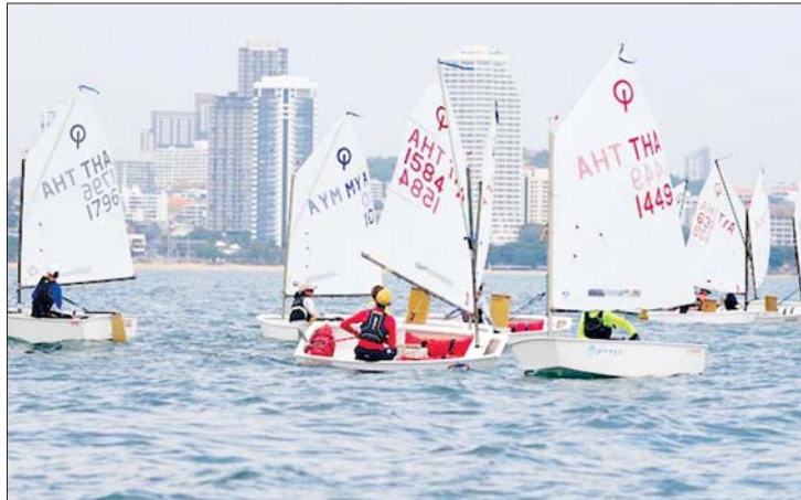
ထိုင်းနိုင်ငံ Eastern Seaboard Regatta ပြိုင်ပွဲတွင် Optimist Class လှေများပြိုင်ပွဲဝင်နေစဉ်။ (၂၀၂၃ ခုနှစ်၊ နိုဝင်ဘာလ)

နိုင်ငံတကာ ရွက်လှေပြိုင်ပွဲများကို မြန်မာနိုင်ငံ ရွက်လှေအဖွဲ့ချုပ်က အိမ်ရှင်အဖြစ် ၁၉၆၁ ခုနှစ် ရန်ကုန်မြို့ အင်းယားကန်တွင် 2 nd SEAP Games၊ ၁၉၆၉ ခုနှစ် ငပလီတွင် 5 th SEAP Games၊ ၁၉၉၆ ခုနှစ် အင်းယားကန်တွင် Myanmar Open & 9 th ASEAN Championships ပြိုင်ပွဲ၊ ၂၀၀၄ ခုနှစ် တွင် ဧရာဝတီတိုင်းဒေသကြီး ချောင်းသာ၌ ASEAN Open Optimist Championship ပြိုင်ပွဲ၊ ၂၀၁၃ ခုနှစ် ဧပြီလတွင် ဧရာဝတီ တိုင်းဒေသကြီး ငွေဆောင်ကမ်းခြေ၌ Myanmar National Sailing Championship (Pre- SEA Games Event)၊ ၂၀၁၃ ခုနှစ် ဒီဇင်ဘာလတွင် ငွေဆောင်၌ 27 th SEA Games ပြိုင်ပွဲ စသည်ဖြင့် လက်ခံကျင်းပနိုင်ခဲ့သည်။ စာမျက်နှာ ၁၁ သို့ *