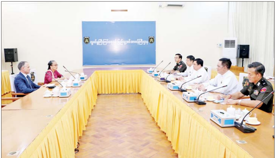
တွေ့ဆုံပွဲသို့ ဒုတိယဝန်ကြီးဦးဌေးလှိုင်နှင့် ဦးဝင်းဇော်အောင်နှင့် တာဝန်ရှိသူများ တက်ရောက်ဒေါက်တာမျိုးသန့်၊ အမြဲတမ်းအတွင်းဝန်ကြကြောင်း သိရသည်။ သတင်းစဉ်

စိစစ်ခံရမည့်သူ၏ သက်သေခံကတ်ပြား (NV Card) ကိုင်ဆောင်ထားသည့် ကုလသမဂ္ဂဝန်ထမ်းအချို့ကို ကိုင်ဆောင်ကတ်ပြားတစ်မျိုးမျိုး ရရှိရေးအတွက် လုပ်ထုံးလုပ်နည်းနှင့်အညီ ဆက်လက်ဆောင်ရွက်ရမည့် အခြေအနေ၊ ခရီးသွားလာခွင့်နှင့် ယာယီနေထိုင်ခွင့်တောင်းခံထားသည့် ကုလသမဂ္ဂအဖွဲ့အစည်းများမှ ဝန်ထမ်းများနှင့် မိသားစုများအတွက် ခွင့်ပြုချက်ရရှိနိုင်ရေး ဆောင်ရွက်ရမည့်နည်းလမ်း၊ ဝန်ကြီးဌာနအနေဖြင့် ဥပဒေ၊ လုပ်ထုံးလုပ်နည်းနှင့်အညီ လုပ်ငန်းများအဆင်ပြေအောင် ညှိနှိုင်းဆောင်ရွက်ပေးနေမှုအပေါ် မြန်မာနိုင်ငံဆိုင်ရာ ကုလသမဂ္ဂအဖွဲ့အစည်းများမှ တာဝန်ရှိသူများအနေဖြင့်လည်း ၎င်းတို့၏ဝန်ထမ်းများကို စနစ်တကျ ထိန်းသိမ်းကြပ်မတ်၍ ပူးပေါင်းဆောင်ရွက်ပေးနိုင်ရေး အခြေအနေတို့နှင့်စပ်လျဉ်း၍ ရင်းနှီးပွင့်လင်းစွာ အမြင်ချင်းဖလှယ် ဆွေးနွေးကြသည်။