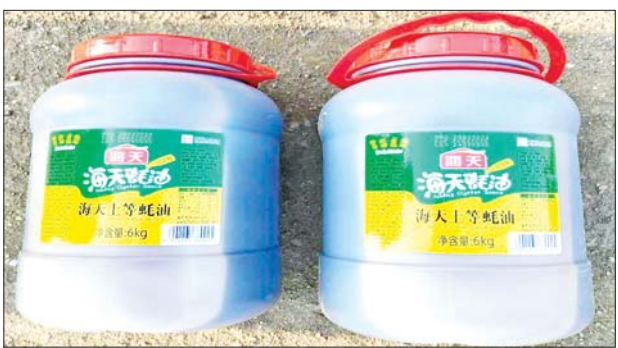
မန္တလေးတိုင်းဒေသကြီး၌ သိမ်းဆည်းရမိမှု။

နေပြည်တော် မေ ၁၅ တရားမဝင် ကုန်သွယ်မှု တိုက်ဖျက်ရေး ဦးဆောင် ကော်မတီ၏ ကြီးကြပ်ကွပ်ကဲမှု ဖြင့် တရားမဝင် ကုန်သွယ်မှုများကို ဥပဒေနှင့်အညီ ထိရောက်စွာ တားဆီးအရေးယူနိုင်ရေး ဆောင်ရွက်လျက်ရှိရာ မေ ၁၃ ရက်တွင် မန္တလေးတိုင်းဒေသကြီး တရားမဝင်ကုန်သွယ်မှု တိုက်ဖျက်ရေး အထူးအဖွဲ့၏ စီမံခန့်ခွဲမှုဖြင့် တာဝန်ကျ ပူးပေါင်းအဖွဲ့က စစ်ဆေးမှုများ ဆောင်ရွက်ခဲ့ရာ ကျွဲတပ်ဆုံ စစ်ဆေးရေးစခန်း၌ တောင်ကြီးမြို့မှ ရန်ကုန်မြို့သို့ မောင်းနှင်လာသည့် ယာဉ်တစ်စီး ပေါ်မှ တရားဝင်စာရွက်စာတမ်း အထောက်အထား တင်ပြနိုင်ခြင်း မရှိသည့် တရုတ်နိုင်ငံထုတ် ဖိနပ် အရန် ၃၀၀၊ ခရုဆီ ပုလင်း ၂၀၀ အပါအဝင် ကုန်ပစ္စည်းနှစ်မျိုး (ခန့်မှန်းတန်ဖိုး ငွေကျပ် ၁၂၀၄၀၀၀)နှင့် အဆိုပါပစ္စည်း များ တင်ဆောင်လာသည့် Nissan Condor Van တစ်စီး (ခန့်မှန်း တန်ဖိုးငွေကျပ် ၄၀၀၀၀၀) စုစုပေါင်း ခန့်မှန်းတန်ဖိုးငွေကျပ် ၅၃၀၄၀၀၀ ကို သိမ်းဆည်းရမိ ခဲ့ပြီး အကောက်ခွန်လုပ်ထုံး လုပ်နည်းများနှင့်အညီ အရေးယူ ဆောင်ရွက်လျက်ရှိသည်။ ထို့ပြင် မေ ၁၃ ရက်တွင် ရန်ကုန်တိုင်းဒေသကြီး တရားမဝင်ကုန်သွယ်မှု တိုက်ဖျက်ရေး အထူးအဖွဲ့၏ စီမံခန့်ခွဲမှုဖြင့် တာဝန်ကျ ပူးပေါင်းအဖွဲ့က စစ်ဆေးမှုများ ဆောင်ရွက်ခဲ့ရာ ရွာသာကြီး Dry Port ၌ မြဝတီ မြို့မှ ရန်ကုန်မြို့သို့ မောင်းနှင်လာ သော ယာဉ်လေးစီးနှင့် သာမည