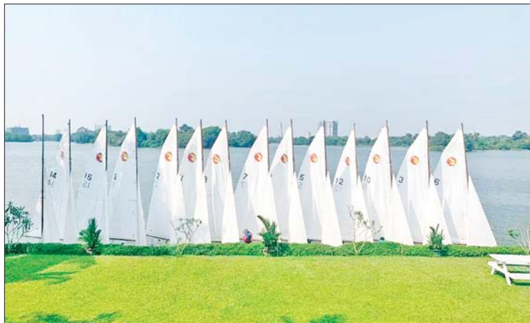
Yangon Sailing Club (YSC) တွင် Sharpies လှေများ Launch ပြုလုပ်ရန် စီတန်းထားစဉ်။