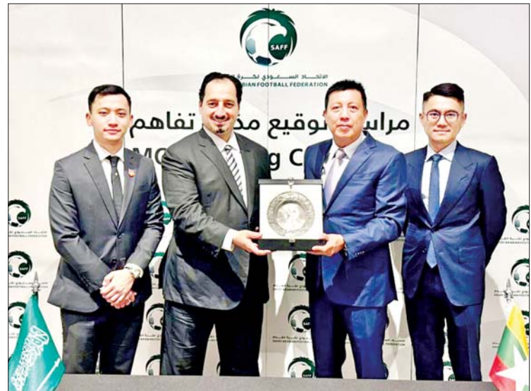
President ဦးဇော်ဇော်သည် အာရှ ဘောလုံးအဖွဲ့ချုပ်၏ အလုပ်အမှုဆောင် အစည်းအဝေး ဆက်လက်တက်ရောက်ခဲ့ သည်။ မြန်မာနိုင်ငံ ဘောလုံးအဖွဲ့ချုပ် ကိုယ်စားလှယ်အဖွဲ့သည် ထိုင်းနိုင်ငံ ဗန်ကောက်မြို့၌ မေ ၁၆ ရက်တွင် ကျင်းပမည့် (၃၄)ကြိမ်မြောက် အာရှ ဘောလုံးအဖွဲ့ချုပ် ကွန်ဂရက်၊ မေ ၁၇ ရက်တွင် ကျင်းပမည့် (၇၄)ကြိမ်မြောက် ဖီဖာကွန်ဂရက်တို့ကို ဆက်လက် တက်ရောက်မည်ဖြစ်သည်။ သတင်း - ကိုညီလေး

ခြင်းကြောင့် လက်ရွေးစင်အသင်းများ စခန်းဝင် လေ့ကျင့်ရေးပြုလုပ်ခြင်း၊ လေ့ကျင့်ရေးနည်းစနစ်များနှင့် ဘောလုံး နည်းဗျူဟာများ အပြန်အလှန် ဖလှယ် ခြင်း၊ လူငယ်လက်ရွေးစင်အသင်းများ၊ အမျိုးသမီးနှင့် ဖူဆယ်လက်ရွေးစင် အသင်းများ၊ ကလပ်အသင်းများအကြား Football Calendar ချိန်ဆ၍ ခြေစမ်းပွဲ များ စီစဉ်ခြင်း၊ လိဂ်ပြိုင်ပွဲများ စီမံခန့်ခွဲ မှုများနှင့် ကစားသမားများဖွံ့ဖြိုးတိုးတက် ရေးနည်းစနစ်များ မျှဝေခြင်း၊ သင်တန်း များစီစဉ်ခြင်း အစရှိသည့် ပူးပေါင်း ဆောင်ရွက်မှုများဖြင့် မြန်မာဘောလုံး အားကစားတိုးတက်ရေးအတွက် ဆောင် ရွက်မည်ဖြစ်ကြောင်း သိရသည်။ အဆိုပါ MoU ရေးထိုးခြင်းအပြီးတွင် အာရှဘောလုံးအဖွဲ့ချုပ် AFC Senior Vice