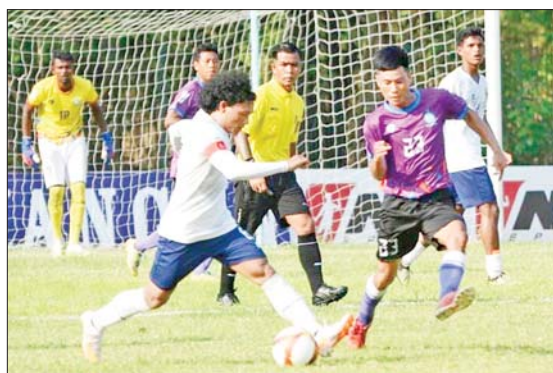
ဒဂုံစတားအသင်းနှင့် ငွေကြယ်ပွင့်အသင်း ယှဉ်ပြိုင်နေစဉ်။