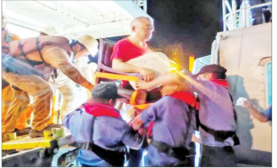
တရုတ်နိုင်ငံပိုင် CHANG HANG HAO HAI အမည်ရှိ ကုန်တင်ရေယာဉ်ကြီးပေါ်မှ ဒဏ်ရာရလူနာအား စစ်ရေယာဉ်ပေါ်သို့ ရွှေ့ပြောင်းနေစဉ်။