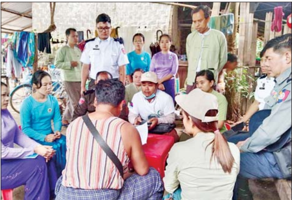
ပဲခူးတိုင်းဒေသကြီး ကျောက်တံခါးမြို့နယ်၌ ၂၀၂၄ ခုနှစ် လူဦးရေနှင့် အိမ်အကြောင်းအရာသန်းခေါင်စာရင်းများ ဒုတိယနေ့ ကောက်ယူစဉ်။ မြို့နယ်(ပြန်/ဆက်)