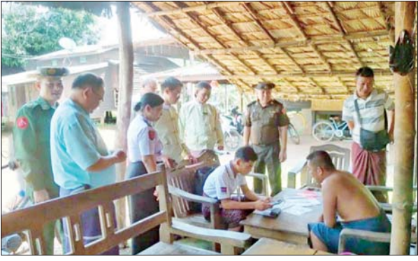
ရန်ကုန်တိုင်းဒေသကြီး လှည်းကူးခရိုင် သန်းခေါင်စာရင်း ကောက်ယူရေးကော်မတီ၏ ကြီးကြပ်မှုဖြင့် ၂၀၂၄ ခုနှစ် လူဦးရေ နှင့် အိမ်အကြောင်းအရာသန်းခေါင်စာရင်း မြို့နယ်အဆင့် စာရင်း စစ်/စာရင်းကောက်များက အောက်တိုဘာ ၂ ရက် နံနက် ၇ နာရီ တွင် မြို့ပေါ် (၅) ရပ်ကွက်နှင့် ကျေးရွာများ၌ စာရင်းကောက်ယူ စဉ်။ မြို့နယ် (ပြန်/ဆက်)