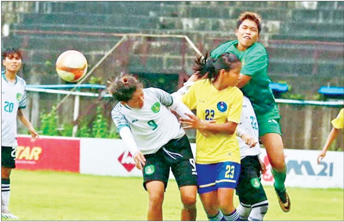
အား/ကာသိပွဲအသင်းနှင့် မြဝတီအသင်းတို့ ယှဉ်ပြိုင်ကစားကြစဉ်။

ဂိုးသွင်းယူ အာဆင်နယ်အသင်းနဲ့ ပီအက်စ်ဂျီအသင်းတို့ပွဲစဉ်မှာ အာဆင်နယ်အသင်းအတွက် သွင်းဂိုးတွေကို ပထမပိုင်းပွဲကစားချိန် မိနစ် ၂၀ မှာ ကိုင်ဟာဗက်ဇ်ကတစ်ဂိုး၊ ၃၅ မိနစ်မှာ ဆာကာကတစ်ဂိုး သွင်းယူပေးခဲ့တာဖြစ်ပါတယ်။ အခြားသောချန်ပီယံလိဂ်ပွဲစဉ်တွေမှာတော့ ဘာစီလိုနာအသင်း၊ ဒေါ့မွန်အသင်းနှင့် မန်စီးတီးအသင်းတို့ဟာ ပြိုင်ဘက်အသင်းအသီးသီးကို အနိုင်ရရှိခဲ့ပြီး ဘာစီလိုနာအသင်းက စာမျက်နှာ ၁၇ ကော်လံ ၅ သို့ ❁