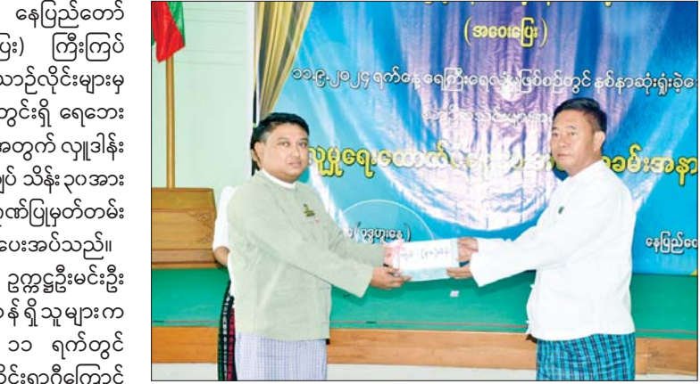
ကားဂိတ်ခန်းနှင့် ယာဉ်အသင်း ပူးတွဲအပိုင် ၂၇ သင်းအတွက် ငွေကျပ် ၁၃၅၀၀၀၀၊ နေ့စဉ် ယာဉ်စီးရေ ငါးစီးနှင့်အထက် ၁၂ သင်းအတွက် ငွေကျပ် ၄၂၀၀၀၀၊ နေ့စဉ် ယာဉ်စီးရေ လေးစီးနှင့်အောက် အသင်း ၅၀