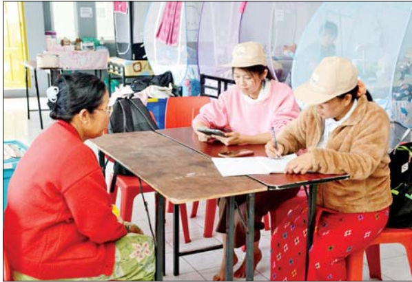
ရှမ်းပြည်နယ် တောင်ကြီးမြို့၌ ၂၀၂၄ ခုနှစ် လူဦးရေနှင့် အိမ်အကြောင်းအရာသန်းခေါင်စာရင်း စတင်ကောက်ယူခြင်းကို အောက်တိုဘာ ၂ ရက် နံနက်ပိုင်းက တောင်ကြီးမြို့နယ်အတွင်းရှိ ရပ်ကွက်နှင့် ကျေးရွာများတွင် ဆက်လက်ကောက်ယူစဉ်။ ခရိုင်(ပြန်/ဆက်)