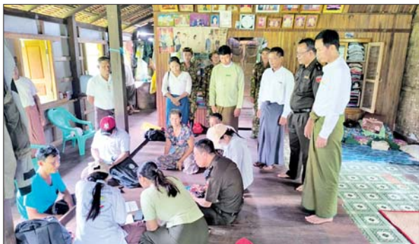
တနင်္သာရီတိုင်းဒေသကြီး ကျွန်းစုမြို့၌ လူဦးရေနှင့် အိမ်အကြောင်းအရာသန်းခေါင်စာရင်းကို မြို့နယ်အတွင်းရှိ မြို့ပေါ် ရပ်ကွက်များနှင့် ကျေးရွာများတွင် စတင်ကောက်ယူစဉ်။ ထက်မြင့်(ကျွန်းစု)