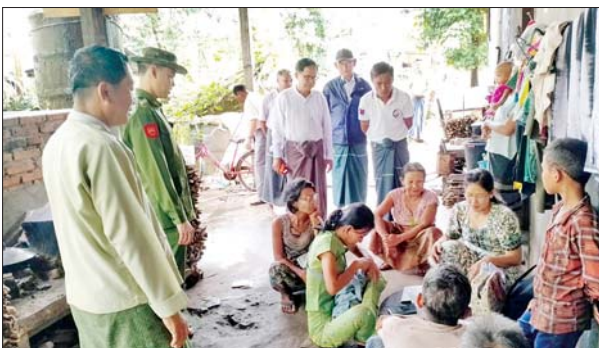
မွန်ပြည်နယ် မုဒုံမြို့နယ်၌ ၂၀၂၄ ခုနှစ် လူဦးရေနှင့် အိမ်အကြောင်းအရာသန်းခေါင်စာရင်းကောက်ယူခြင်းကို မြို့မ(၁) နိုင်လုံကွမ်လှ ရပ်ကွက်/ကျေးရွာများ၌ စတင်ကွင်းဆင်းကောက်ယူ စဉ်။ အောင်မျိုးသူ (ပြန်/ဆက်)