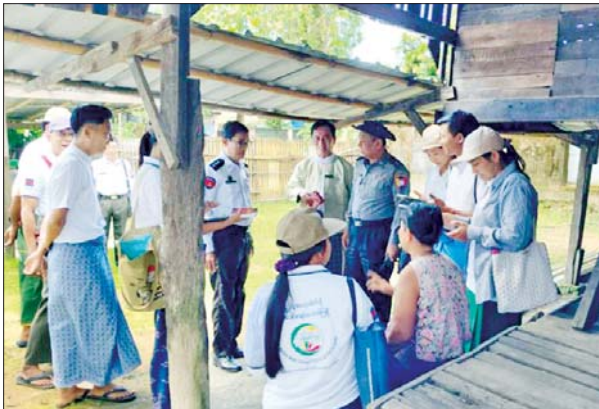
ပဲခူးတိုင်းဒေသကြီး ဒိုက်ဦးမြို့နယ်၌ ၂၀၂၄ ခုနှစ် လူဦးရေနှင့် အိမ်အကြောင်းအရာသန်းခေါင်စာရင်းများ ဒုတိယနေ့ကောက်ယူ စဉ်။ ကျော်ကျော်(ပြန်/ဆက်)