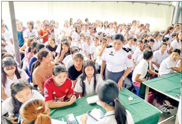
မင်္ဂလာဒုံမြို့နယ်၌ ၂၀၂၄ ခုနှစ် လူဦးရေနှင့် အိမ်အကြောင်း အရာသန်းခေါင်စာရင်း ကောက်ယူရေးလုပ်ငန်းများကို အောက်တိုဘာ ၁ ရက် နံနက်ပိုင်းမှစ၍ ကောက်ယူလျက်ရှိသည်ကို တွေ့ရစဉ်။ မြို့နယ်(ပြန်/ဆက်)