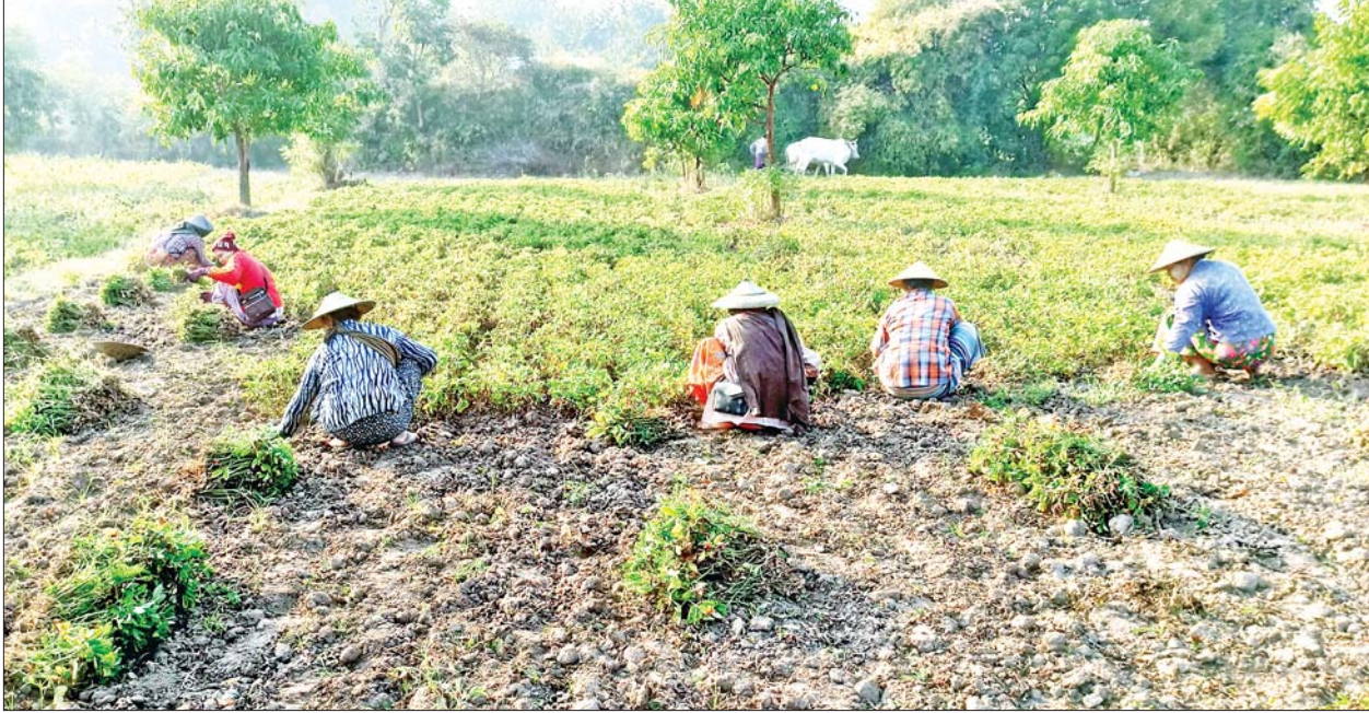
ကျွန်းလှမြို့နယ်၌ မိုးမြေပဲ နုတ်သိမ်းနေမှုကို တွေ့ရစဉ်။

နေပြည်တော် အောက်တိုဘာ ၂ ယနေ့ညနေ ၅ နာရီခွဲ တိုင်းထွာချက်များအရ အနောက်ဘက်မှ ရွေ့လျားလာသော လေပွေလှိုင်းများ၏အရှိန်ကြောင့် လည်းကောင်း၊ အပူပြန်တက်တိမ်များဖြစ်ထွန်းမှု အားကောင်းခြင်းကြောင့်လည်း ကောင်း၊ ကပ္ပလီပင်လယ်ပြင်နှင့် ဘင်္ဂလားပင်လယ်အော်တို့မှ လေနှေး များနှင့်တရုတ်ပြည်မကြီးပေါ်ရှိ လေဖိအားကြီးရပ်ဝန်းဒေသမှ ရွေ့လျား လာသော လေအေးများတွေ့ဆုံမှုကြောင့်လည်းကောင်း၊ တောင်တရုတ် ပင်လယ်ပြင်တွင် ဖြစ်ပေါ်နေသော တိုင်ဖွန်းမုန်တိုင်း “ကရုတ်သွန်”မှ ပြတ်ထွက်လာသော တိမ်တိုက်များကြောင့်လည်းကောင်း ယနေ့ညမှ အောက်တိုဘာ ၆ ရက်အတွင်း နေပြည်တော်၊ စစ်ကိုင်းတိုင်းဒေသ ကြီး၊ မန္တလေးတိုင်းဒေသကြီး၊ မကွေးတိုင်းဒေသကြီး၊ ဧရာဝတီတိုင်း ဒေသကြီး၊ တနင်္သာရီတိုင်းဒေသကြီး၊ ကချင်ပြည်နယ်၊ ချင်းပြည်နယ်၊ ရခိုင်ပြည်နယ်၊ ကရင်ပြည်နယ်နှင့် မွန်ပြည်နယ်တို့တွင် နေရာအနှံ့ အပြား မိုးထစ်ချရန်ရှိပြီး အချို့ဒေသများတွင် ဒေသအလိုက်နှင့် နေရာကွက်၍ မိုးကြီးခြင်းများနှင့်အတူ လေပြင်းတိုက်ခတ်ခြင်းများ ဖြစ်ပေါ်နိုင်ကာ ပဲခူးတိုင်းဒေသကြီး၊ ရန်ကုန်တိုင်းဒေသကြီး၊ ရှမ်း ပြည်နယ်နှင့် ကယားပြည်နယ်တို့တွင် နေရာကျကျမှ နေရာစိပ်စိပ် မိုးထစ်ချရန်ရှိနိုင်ပါသည်။ စာမျက်နှာ ၄ ကော်လံ ၁ သို့ ၀