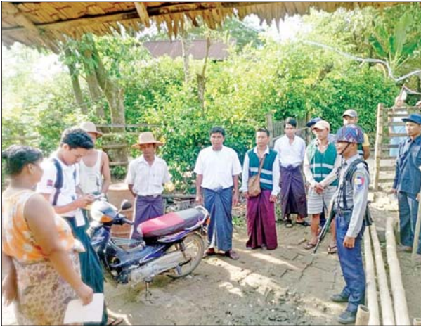
ဧရာဝတီတိုင်းဒေသကြီး ဓနုမြို့မြို့နယ်၌ ၂၀၂၄ ခုနှစ် လူဦးရေ နှင့် အိမ်အကြောင်းအရာ သန်းခေါင်စာရင်းများ ဒုတိယနေ့ ကောက်ယူစဉ်။ အောင်ပြည့်ဖြိုးဇော်(ပြန်/ဆက်)