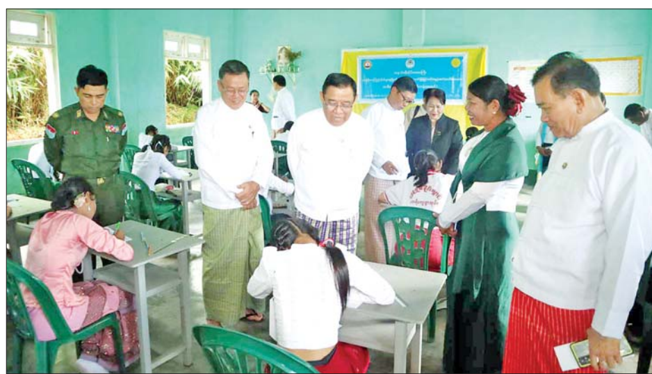
ဖဲကြိုးဖြတ်ဖွင့်လှစ်ပေးသည်။ ထို့နောက် တိုင်းဒေသကြီးဝန်ကြီးချုပ်က ကျောင်းစာကြည့်တိုက်များ ဖွံ့ဖြိုးတိုးတက်ရေးနှင့် စာဖတ်ရိုက်မြှင့်တင်ရေးပွဲတော်အတွင်း ခင်းကျင်းပြသထားသည့် လှပသာယာပြည်မြန်မာ ရောင်စုံဓာတ်ပုံများ၊ စကားရည်လှပြိုင်ပွဲ၊ အထက်တန်းအဆင့်နှင့်

ထားဝယ် အောက်တိုဘာ ၂ တနင်္လာရက်နေ့တွင် အစိုးရအဖွဲ့၏စီမံမှုဖြင့် ပြန်ကြားရေးနှင့် ပြည်သူ့ဆက်ဆံရေးဦးစီးဌာနနှင့် အခြေခံပညာဦးစီးဌာနတို့ ပူးပေါင်းကျင်းပသော ကျောင်းစာကြည့်တိုက်များ ဖွံ့ဖြိုးတိုးတက်ရေးနှင့် စာဖတ်ရိုက်မြှင့်တင်ရေးပွဲတော်ကို ယနေ့နံနက် ၉ နာရီက ထားဝယ်မြို့ အမှတ်(၅)အခြေခံပညာ အထက်တန်းကျောင်း၌ စည်ကားသိုက်မြိုက်စွာ ကျင်းပသည်။ ဦးစွာ တိုင်းဒေသကြီးဝန်ကြီးချုပ် ဦးမြတ်ကို၊ တိုင်းဒေသကြီး တရားလွှတ်တော်တရားသူကြီးချုပ် ဒေါ်ပိုင်ပိုင်အေး၊ ကမ်းရိုးတန်းဒေသတိုင်းစစ်ဌာနချုပ် ဒုတိယတိုင်းမှူးဗိုလ်မှူးချုပ်အောင်မျိုးထွန်း၊ တိုင်းဒေသကြီး လူမှုရေးရာဝန်ကြီး ဦးသက်နိုင်၊ တိုင်းဒေသကြီး ပညာရေးညွှန်ကြားရေးမှူးဦးဝင်းနောင်တို့က ကျောင်းစာကြည့်တိုက်များ ဖွံ့ဖြိုးတိုးတက်ရေးနှင့် စာဖတ်ရိုက်မြှင့်တင်ရေးပွဲတော်အား