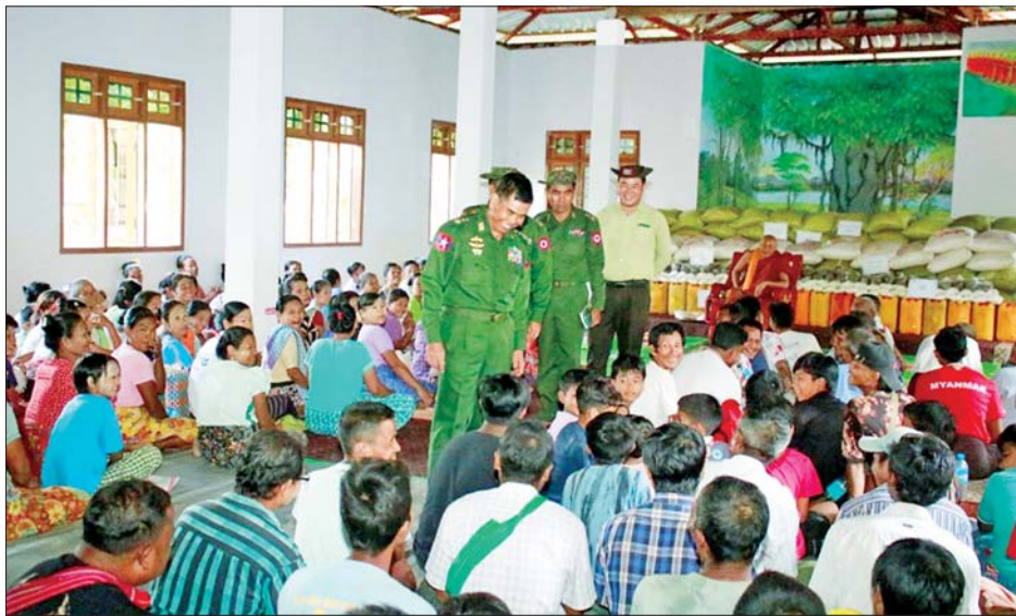
ပူးပေါင်း၍ တက်ကြွစွာ ဆောင်ရွက်ပေးလျက်ရှိသည်။ ပေးအပ်လှူဒါန်းလျက်ရှိ ထိုပြင် ယာယီရေဘေးရှောင်စခန်းများတွင် ရေဘေးသင့်ပြည်သူများအား ကျန်းမာရေးအဖွဲ့များ က လိုအပ်သည့် ကျန်းမာရေးစောင့်ရှောက်မှုလုပ်ငန်း များနှင့် ကျန်းမာရေးအသိပညာပေး ဟောပြော

နေပြည်တော် အောက်တိုဘာ ၂ နေပြည်တော်ကောင်စီနယ်မြေ အပါအဝင် တိုင်းဒေသကြီးနှင့် ပြည်နယ်များရှိ ရေကြီးရေလျှံမှု ဖြစ်ပေါ်ခဲ့သည့် ရပ်ကွက်/ကျေးရွာများတွင် ကူညီ ကယ်ဆယ်ရေးလုပ်ငန်းများနှင့် ပြန်လည်ထူထောင် ရေးလုပ်ငန်းများကို အင်တိုက်အားတိုက် တက်ကြွ စွာ ပူးပေါင်းဆောင်ရွက်ပေးလျက်ရှိရာ ယနေ့တွင် လည်း နေပြည်တော်ကောင်စီနယ်မြေ ဇေယျာသီရိ မြို့နယ်၊ ပျဉ်းမနားမြို့နယ်၊ လယ်ဝေးမြို့နယ်၊ ပုဗ္ဗသီရိ မြို့နယ်တို့တွင်လည်းကောင်း၊ ကယားပြည်နယ် လှိုင်ကော်မြို့နယ်တွင်လည်းကောင်း ဘုန်းတော်ကြီး ကျောင်းများ၊ စာသင်ကျောင်းများ၊ ဆေးရုံ၊ ဆေးခန်း များ၊ ဌာနဆိုင်ရာအဆောက်အအုံများတွင် လိုအပ် သည့်ကုန်ပစ္စည်းများ ပေးအပ်ခြင်းနှင့် သန့်ရှင်းရေး လုပ်ငန်းများ ဆောင်ရွက်ပေးခြင်း၊ လမ်း၊ တံတားများ၊ ရပ်ကွက်၊ ကျေးရွာများအတွင်း၌ တင်ကျန်ခဲ့သည့် နှမ်းများ၊ သစ်ပင်သစ်ကိုင်းများဖယ်ရှားပေးခြင်း အပါအဝင် အခြားလိုအပ်သည့်ကုန်ပစ္စည်းများကို တပ်မတော် သားများ၊ မြန်မာနိုင်ငံရဲတပ်ဖွဲ့ဝင်များ၊ မီးသတ်တပ်ဖွဲ့ ဝင်များ၊ ကြက်ခြေနီတပ်ဖွဲ့ဝင်များနှင့် လူမှုဝန်ထမ်း ကယ်ဆယ်ရေးအဖွဲ့များက ဒေသခံပြည်သူများနှင့်