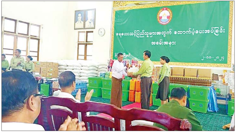
ရေဘေးကြောင့်ဆုံးရှုံးခဲ့သော ငါးမွေးတောင်သူ ၁၀ ကောင်ရေ ၆၃၃၄၀ အား အခမဲ့ထောက်ပံ့ပေးအပ် ဦးအား နှစ်လက်မရွယ် ငါးမြစ်ချင်း သားပေါက် ခွဲကြောင်း သိရသည်။ သတင်းစဉ်

အဆိုပါအခမ်းအနားတွင် ကုမဲငါးလုပ်ငန်းစခန်း က ကျောက်ဆည်မြို့နယ်နှင့် မြစ်သားမြို့နယ်မှ