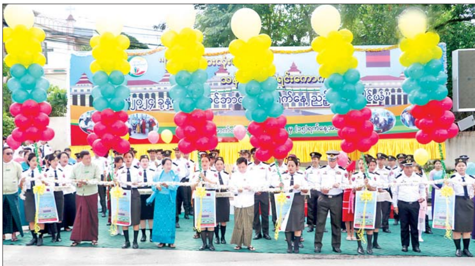
မြန်မာနိုင်ငံ အမျိုးသမီးရေးရာအဖွဲ့ချုပ်ဥက္ကဋ္ဌ ဒေါက်တာသက်သက်ဇင်၊ ဌာနဆိုင်ရာတာဝန်ရှိသူများ၊ ခရိုင်နှင့် မြို့နယ် သန်းခေါင်စာရင်းကော်မတီဝင်များ၊ လူမှုရေးအသင်းအဖွဲ့များ၊ ဆရာ ဆရာမများနှင့် ကျောင်းသား ကျောင်းသူများ၊ ဘင်ခရာနှင့် ပန်းဖွားအကအဖွဲ့များ၊ ဒေသခံပြည်သူများ တက်ရောက်ကြသည်။

၂၀၂၄ ခုနှစ် လူဦးရေနှင့် အိမ်အကြောင်းအရာ သန်းခေါင်စာရင်းကောက်ယူခြင်းလုပ်ငန်းကို ပြည်သူများ သိရှိနားလည်ပေးပေးပါဝင်လာစေရေးအတွက် ပြည်သူ့လူထုအသိပညာပေးလုပ်ငန်းတစ်ရပ်ဖြစ်သည့် သန်းခေါင်စာရင်းကောက်ယူရေးဆိုင်ရာ ဆိုင်ဘုတ်များကို တိုင်းဒေသကြီး/ပြည်နယ်အသီးသီးရှိ ခရိုင်အလိုက် မြို့ကြီးများ၏ လူစည်ကားရာနေရာများ၊ လမ်းဆုံလမ်းခွဲများတွင်စိုက်ထူဆောင်ရွက်လျက်ရှိရာ ပြည်ထောင်စုနယ်မြေ နေပြည်တော် ပျဉ်းမနားခရိုင်အတွင်း သန်းခေါင်စာရင်းကောက်ယူရေးဆိုင်ရာ အသိပညာပေးဆိုင်ဘုတ် စိုက်ထူပွဲကို ယနေ့နံနက် ၈ နာရီခွဲက ပျဉ်းမနားမြို့နယ် မြို့တွင်းလမ်းဆုံ၌ ကျင်းပသည်။