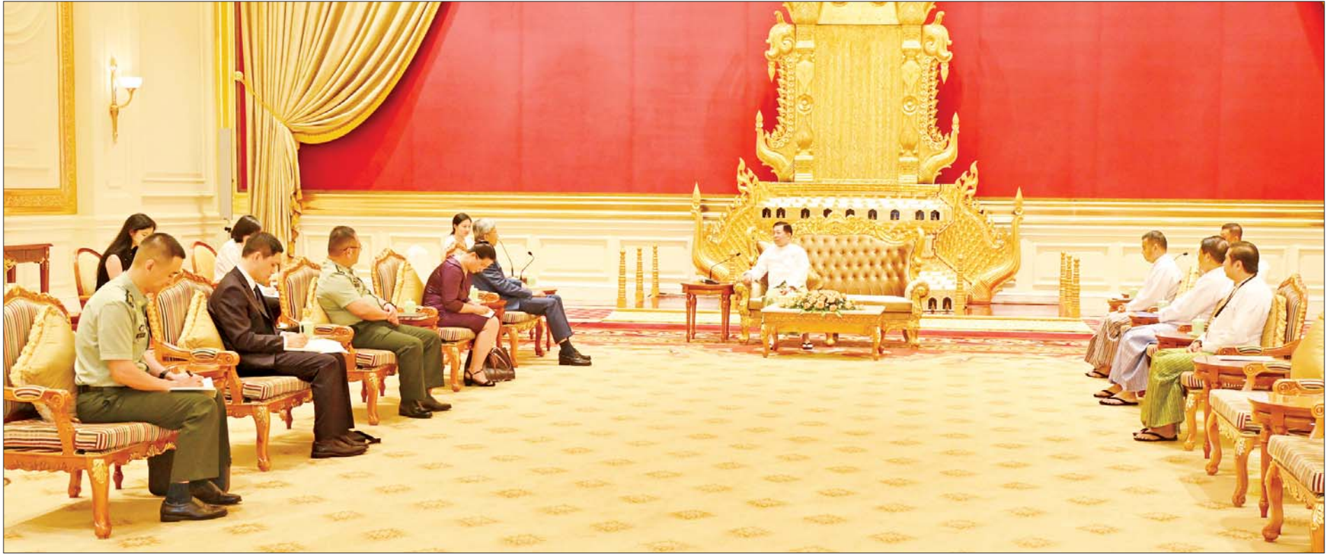
နိုင်ငံတော်စီမံအုပ်ချုပ်ရေးကောင်စီဥက္ကဋ္ဌ နိုင်ငံတော်ဝန်ကြီးချုပ် ဗိုလ်ချုပ်မှူးကြီးမင်းအောင်လှိုင် မြန်မာနိုင်ငံဆိုင်ရာ တရုတ်ပြည်သူ့သမ္မတနိုင်ငံ သံအမတ်ကြီး H.E. Mr. Chen Hai အား လက်ခံတွေ့ဆုံစဉ်။

★ ရှေ့ဖုံးမှ နှစ်နိုင်ငံအကြား အဆင့်မြင့်အရာရှိကြီးများ ချစ်ကြည်ရေးခရီးများ အပြန်အလှန် သွားရောက်လျက်ရှိသည့် အခြေအနေများ၊ မြန်မာနိုင်ငံဖွံ့ဖြိုးတိုးတက်ရေးနှင့် ပြည်တွင်း ငြိမ်းချမ်းမှုရရှိရေးအတွက် နိုင်ငံတော်မှ ကြိုးပမ်းဆောင်ရွက်လျက် ရှိမှုနှင့် တရုတ်နိုင်ငံမှ ကူညီဆောင်ရွက်ပေးနေမှုအခြေအနေများ၊ နယ်စပ်ဒေသ တည်ငြိမ်အေးချမ်းရေးအတွက် ပူးပေါင်းဆောင်ရွက်လျက်ရှိသည့် အခြေအနေများနှင့် လွတ်လပ်ပြီးတရားမျှတသည့် ပါတီစုံ ဒီမိုကရေစီ အထွေထွေရွေးကောက်ပွဲ ကျင်းပနိုင်ရေး ကြိုတင်ပြင်ဆင်ဆောင်ရွက်လျက်ရှိသည့် အခြေအနေများနှင့် စပ်လျဉ်းပြီး ရင်းနှီးပွင့်လင်းစွာ အမြင်ချင်းဖလှယ်ဆွေးနွေးခဲ့ကြသည်။ တက်ရောက် အဆိုပါတွေ့ဆုံပွဲသို့ နိုင်ငံတော်စီမံအုပ်ချုပ်ရေးကောင်စီဥက္ကဋ္ဌ နိုင်ငံတော်ဝန်ကြီးချုပ်နှင့်အတူ ကောင်စီဖွဲ့ဝင်