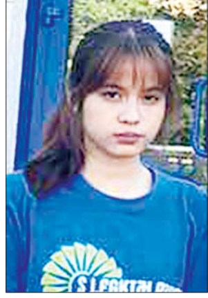
မဝတ်ရည်ပဝင်း