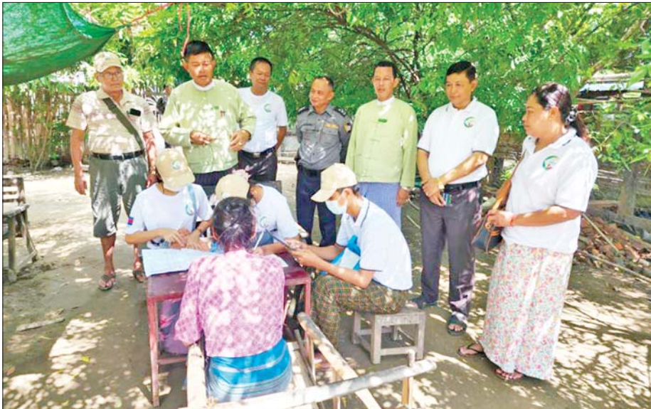
စစ်ကိုင်းတိုင်းဒေသကြီး မုံရွာမြို့၌ ၂၀၂၄ ခုနှစ် လူဦးရေနှင့် အိမ်အကြောင်းအရာသန်းခေါင်စာရင်း ကောက်ယူနိုင်ရေးအတွက် စမ်းသပ်သန်းခေါင်စာရင်းကောက်ယူစဉ်။

နိုင်ငံတစ်နိုင်ငံအတွင်း မှီတင်းနေထိုင်ကြသော နိုင်ငံသူ နိုင်ငံသား လူတစ်ဦးချင်းစီ၏ အသက်၊ လူမျိုး၊ ကိုးကွယ်သည့်ဘာသာ၊ ယောက်ျား၊ မိန်းမ အလုပ်အကိုင် စသည့်အချက်အလက်များနှင့် ပတ်သက်၍ အပြည့်အစုံမှတ်တမ်းတင်ထားသော စာရင်းကို “သန်းခေါင်စာရင်း”ဟု ခေါ်ဆိုသည်။ သန်းခေါင်စာရင်းကို အင်တိုက်အားတိုက်အားဖြင့် Censure ဟုခေါ်ဆိုပြီး လက်တင်ဘာသာစကား Censere မှ ဆင်းသက်လာ၏။ ကုလသမဂ္ဂက သန်းခေါင်စာရင်းကောက်ယူခြင်းနှင့် ပတ်သက်၍ “၁၀ နှစ်လျှင် တစ်ကြိမ် ကောက်ယူရန်၊ လူတစ်ဦးချင်းစီကို ကောက်ယူရန်၊ နယ်နိမိတ် တစ်ခုအတွင်းရှိ နေထိုင်သူအားလုံးကို ကောက်ယူ ရန်၊ သတ်မှတ်ထားသောအချိန်ကာလအတွင်း တစ်ပြိုင်တည်းကောက်ယူရန်၊ နိုင်ငံတကာကျင့်သုံး မှုများနှင့် ကိုက်ညီရန်”စသည်ဖြင့် အကြံပြုထား သည်။ ယနေ့ခေတ်တွင် သန်းခေါင်စာရင်းကောက်ယူ ရာတွင် လူဦးရေအရေအတွက်ကိုသာမကဘဲ တစ်ဦး ချင်းစီ၏ ဝိသေသအသေးစိတ်အချက်အလက်များ ကိုပါ ကောက်ယူလျက်ရှိရာ “လူဦးရေနှင့် အိမ် အကြောင်းအရာသန်းခေါင်စာရင်း”ဟု ခေါ်ဆိုသည်။