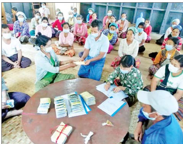
ကျေးရွာစီမံကိန်း အသင်းသူ အသင်းသားများနှင့် တွေ့ဆုံကာ လည်ပတ်ရန်ပုံငွေများ ထုတ်ချေးခြင်း၏ ရည်ရွယ်ချက်များနှင့် အကျိုးကျေးဇူးများကို ရှင်းလင်းပြောကြားခဲ့သည်။ ဆက်လက်၍ စီမံကိန်းတာဝန်ခံနှင့် ဝန်ထမ်းများက စီမံကိန်းအကြောင်းအရာများ၊ အတိုးနှုန်းနှင့် ကာလသတ်မှတ်ချက်များ၊

ရှမ်းပြည်နယ် (တောင်ပိုင်း) ဓနကိုယ်ပိုင်အုပ်ချုပ်ခွင့်ရဒေသ ပင်းတယမြို့နယ် ကျေးလက်ဒေသဖွံ့ဖြိုးတိုးတက်ရေးဦးစီးဌာနက မြစ်မီးရောင်ကျေးရွာစီမံကိန်းအရင်းမပျောက် လည်ပတ်ရန်ပုံငွေများ ဒေသအကြိမ်မြောက် ထုတ်ချေးခြင်း အခမ်းအနားကို ယနေ့နံနက်ပိုင်းက တာဝန်ရှိသူများက ရွှေပုထိုး(မြောက်)ကျေးရွာအုပ်စုအင်းငယ်ကျေးရွာ၌ထုတ်ချေးပေးခဲ့သည်။