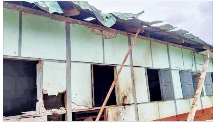
အကြမ်းဖက်သောင်းကျန်းသူများက လားရှိုးမြို့အတွင်းသို့ ရှော့တိုက်ခွဲများဖြင့် ပစ်ခတ်တိုက်ခိုက်ခဲ့မှုကြောင့် အဆောက်အအုံများ ထိခိုက်ပျက်စီးမှုမှတ်တမ်းဓာတ်ပုံ။

အချို့ ထိခိုက်ဒဏ်ရာရရှိခဲ့ကြောင်းကို သတင်းထုတ်ပြန်ပြီးဖြစ်သည်။ ယနေ့တွင်လည်း အကြမ်းဖက်သောင်းကျန်းသူများသည် လားရှိုးမြို့အတွင်းသို့ ရှော့တိုက်ခွဲများဖြင့်