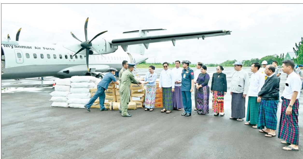
နိုင်ငံတော်စီမံအုပ်ချုပ်ရေးကောင်စီအဖွဲ့ဝင် ဒေါ်ဒွဲဘူ မြစ်ကြီးနားမြို့ ရေဘေးသင့်ပြည်သူများအတွက် ထောက်ပံ့ပစ္စည်းများ ပေးအပ်စဉ်။

မြစ်ကြီးနား ဇူလိုင် ၄ မိုးသည်းထန်စွာ အဆက်မပြတ် ရွာသွန်းခဲ့သဖြင့် မြစ်ကြီးနားမြို့၌ ဇူလိုင် ၃၀ ရက်ကစ၍ စံချိန်တင် မြစ်ရေကြီးမြင့်မှု ဖြစ်ပေါ်ခဲ့ရာ ရေဘေးသင့် ပြည်သူများအား ရေဘေးရှောင်စခန်းများ ဖွင့်လှစ်၍ ကူညီကယ်ဆယ် ထောက်ပံ့ပေး လျက်ရှိပြီး အဆိုပါရေဘေးသင့် ပြည်သူများအား ပြန်လည် ထူထောင်ရေးနှင့် အားပေး ထောက်ပံ့မှုများ ဆောင်ရွက်နိုင်ရေး အတွက် နိုင်ငံတော်စီမံအုပ်ချုပ် ရေးကောင်စီအဖွဲ့ဝင် ဒေါ်ဒွဲဘူ သည် ယနေ့နံနက်ပိုင်းတွင် တပ်မတော်လေယာဉ်ဖြင့် မြစ်ကြီး နားမြို့သို့ ရောက်ရှိသည်။