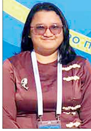
မခြူးအိမ်စည်