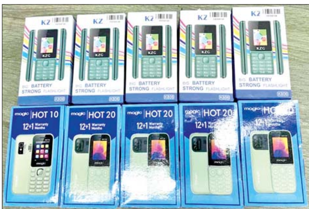
၂၀၂၄ ခုနှစ် ဇွန်လအတွင်း သိမ်းဆည်းရမိမှု။

တာဝန်သိပြည်သူများ၏ သတင်းပေးတိုင်ကြားမှုများကြောင့် ၂၀၂၄ ခုနှစ် ဇွန်လအတွင်း သတင်းပေးရရှိမှု ၄၃ ကြိမ်ရရှိခဲ့ပြီး သတင်းမှား ရှစ်ကြိမ်၊ နောက်ကျသတင်း နှစ်ကြိမ်နှင့် ဖမ်းဆီးရမိမှု ၃၃ ကြိမ် ဖြစ်သည်။ သတင်းပေးရရှိမှုကြောင့် ဖမ်းဆီးရမိမှုတွင် (၆၁) မှု ဖွင့်လှစ်ထား ပြီး ဖမ်းဆီးရမိမှုများတွင် သစ်မျိုးစုံ၊ လုပ်ငန်းသုံးပစ္စည်းများ၊ လူသုံးကုန် ပစ္စည်းများနှင့် စားသောက်ကုန်ပစ္စည်းများဖြစ်သော ကုန်ပစ္စည်း ၇၀ အပါအဝင် ခန့်မှန်းတန်ဖိုးကျပ် ၁၀၉၅ ဒသမ ၅၀ သန်းနှင့် တရားမဝင် ကုန်စည်များ တင်ဆောင်လာသည့် ယာဉ်များ သိမ်းဆည်းရမိခဲ့သည်။ ၂၀၂၄ ခုနှစ် ဇွန်လအတွင်း သတင်းပေးတိုင်ကြားခဲ့သည့် တာဝန်သိ ပြည်သူများကိုလည်း သိမ်းဆည်းရမိမှု တန်ဖိုးငွေကျပ် ၁၀၉၅ ဒသမ ၅၀ သန်း၏ ၂၀ ရာခိုင်နှုန်းဖြစ်သော ငွေကျပ် ၂၁၉ ဒသမ ၁ သန်းကို