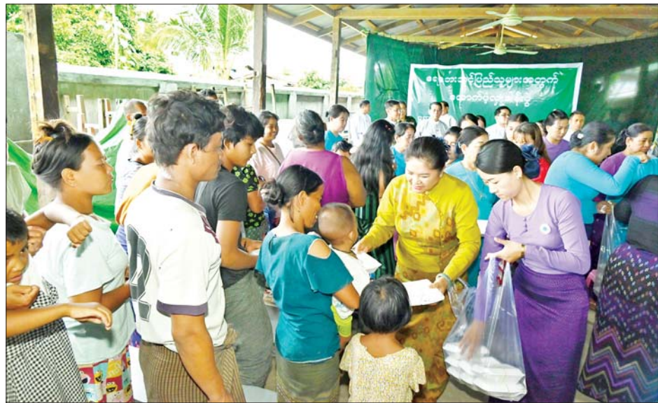
နိုင်ငံတော်စီမံအုပ်ချုပ်ရေးကောင်စီအဖွဲ့ဝင် ဒေါ်ဒွဲဘူ မြစ်ကြီးနားမြို့ ရေဘေးသင့်ပြည်သူများအတွက် ထမင်းဘူးများ ထောက်ပံ့လှူဒါန်းစဉ်။

ဝမ်းမြောက်စကားပြောကြား ဆက်လက်၍ နိုင်ငံတော်စီမံ အုပ်ချုပ်ရေးကောင်စီ အဖွဲ့ဝင်က ရေဘေးသင့် ပြည်သူများအတွက် မြစ်ကြီးနား ယူနန်ဘုံကျောင်းနှင့် ထိန်ချီးဟုန်ရွှင် ကုမ္ပဏီတို့က ပြည်နယ် သဘာဝဘေးအန္တရာယ် ဆိုင်ရာ စီမံခန့်ခွဲမှုကော်မတီထံ ပေးအပ်လှူဒါန်းသည့် ငွေကျပ် သိန်း ၂၀၀၊ ဆန်အိတ် ၄၀၀၊ ဆီ ၁၀ ပိဿာဘူး ၁၀၀၊ ခေါက်ဆွဲ ခြောက်ဖာ ၃၀၀ နှင့် ရေသန့်ဘူး များကို လက်ခံရယူပြီး ဂုဏ်ပြု မှတ်တမ်းလွှာ ပြန်လည်ပေးအပ် ၍ မြစ်ကြီးနား ယူနန်ဘုံကျောင်း ဥက္ကဋ္ဌ ဦးအောင်မြင့်က လှူဒါန်း ခြင်းနှင့်စပ်လျဉ်း၍ ရှင်းလင်း တင်ပြကာ ပြည်နယ်ဝန်ကြီးချုပ် က ကျေးဇူးတင်ဝမ်းမြောက်စကား ပြောကြားသည်။