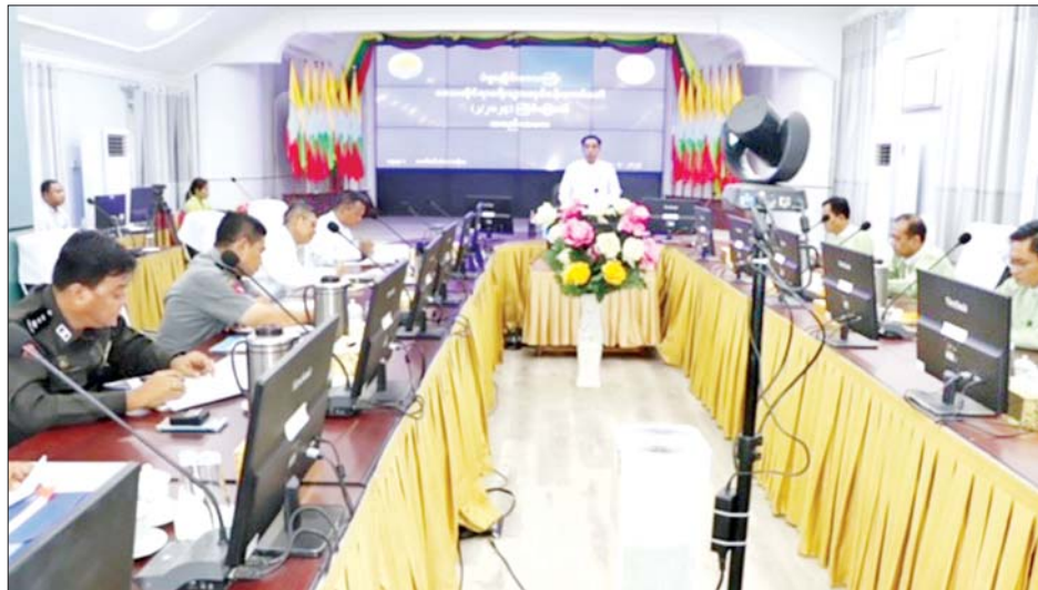
ကို အင်္ဂလိပ်ဘာသာ၊ ထိုင်းဘာသာတို့နှင့် ထုတ်ဝေ ထိုနောက်တိုင်းဒေသကြီးဒေသဆိုင်ရာခရီးသွား လုပ်ငန်းကော်မတီ အတွင်းရေးမှူး ဟိုတယ်နှင့် ခရီးသွားလာရေးညွှန်ကြားမှုဦးစီးဌာန တိုင်းဒေသကြီး

ပဲခူးတိုင်းဒေသကြီး ဝန်ကြီးချုပ် ဦးမျိုးဆွေဝင်း ဦးဆောင်၍ ဒေသဆိုင်ရာ ခရီးသွားလုပ်ငန်းကော်မတီ လုပ်ငန်းညှိနှိုင်းအစည်းအဝေး အမှတ်စဉ် (၂/၂၀၂၄)ကို ယမန်နေ့ မွန်းလွဲပိုင်းက ပဲခူးတိုင်းဒေသကြီးအစိုးရအဖွဲ့ရုံး တော်ဝင်ဟံသာအစည်းအဝေးခန်းမ၌ ကျင်းပသည်။ ဦးစွာ ဒေသဆိုင်ရာခရီးသွားလုပ်ငန်းကော်မတီ ဥက္ကဋ္ဌ တိုင်းဒေသကြီးဝန်ကြီးချုပ်က ပဲခူးဒေသသို့ ဇွန်လအတွင်း ပြည်ပခရီးသွားအုပ်စုလိုက် ခုနစ်ကြိမ် လာရောက်လည်ပတ်ခဲ့ပြီး အများစုမှာ ထိုင်းလူမျိုးများဖြစ်ကြောင်း၊ ပဲခူးတိုင်းဒေသကြီးသို့ လာရောက်လည်ပတ်မည့် ခရီးသွားဧည့်သည်များအတွက် သတင်းအချက်အလက်များပေးနိုင်ရေး နိုင်ငံတကာနှင့် ပြည်တွင်းခရီးသွားပြပွဲများတွင် တိုင်းဒေသကြီး၏ ခရီးသွားလုပ်ငန်းဆိုင်ရာ သတင်းအချက်အလက်များဖြန့်ဖြူးပေးနိုင်ရေး Bago Tourist Guide Map