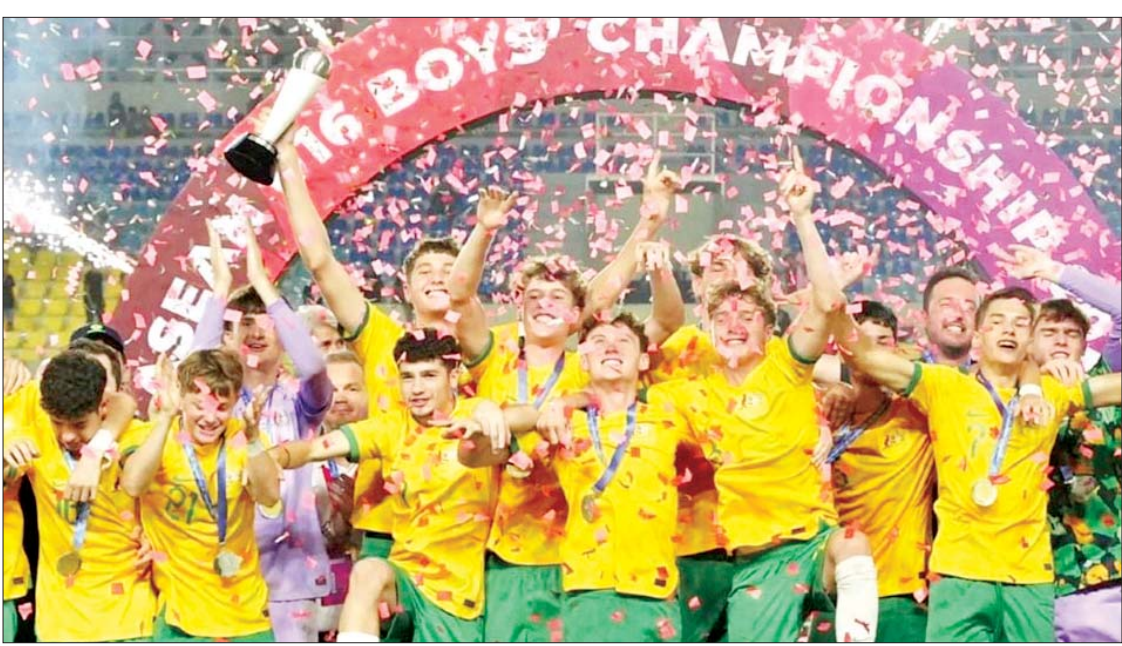
ဩစတြေးလျအသင်းကစားသမားများ အောင်ပွဲခံနေစဉ်။