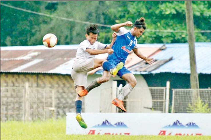
ရတနာပုံအသင်းနှင့် မဟာယူနိုက်တက်အသင်းတို့ ယှဉ်ပြိုင်ကစားကြစဉ်။

အနိုင်ရ ပွဲစဉ် (၅) တွင် ရှမ်းယူနိုက်တက်အသင်းက မြဝတီအသင်းကို ငါးဂိုးပြတ်၊ အား/ကာ သိပ္ပံအသင်းက ရန်ကုန်ယူနိုက်တက်အသင်းကို တစ်ဂိုး-ဂိုးမရှိဖြင့် အနိုင်ရပြီး ရခိုင် ယူနိုက်တက်နှင့် ဧရာဝတီယူနိုက်တက်အသင်းတို့ တစ်ဂိုးစီသာရော Dagon Port အသင်း နှင့် ဒဂုံစတားယူနိုက်တက်အသင်းတို့ နှစ်ဂိုးစီသာရော စာမျက်နှာ၂၀ ကော်လံ ၃ သို့