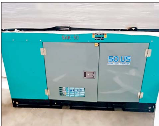
မြန်မာ့စက်မှုဆိပ်ကမ်း၌ သိမ်းဆည်းရမိမှု။

တရားမဝင် ကုန်သွယ်မှု တိုက်ဖျက်ရေး ဦးဆောင်ကော်မတီ ၏ကြီးကြပ်ကွပ်ကဲမှုဖြင့် တရားမဝင် ကုန်သွယ်မှုများကို ဥပဒေနှင့်အညီ ထိရောက်စွာ တားဆီးအရေးယူနိုင် ရေး ဆောင်ရွက်လျက်ရှိရာ ဇူလိုင် ၃ ရက်တွင် အကောက်ခွန်ဦးစီးဌာန ၏ စီမံခန့်ခွဲမှုဖြင့် တာဝန်ကျပူးပေါင်း အဖွဲ့က စစ်ဆေးမှုများဆောင်ရွက် ခဲ့ရာ မြန်မာ့စက်မှုဆိပ်ကမ်း၌ ကုန်သေတ္တာ သုံးလုံးအတွင်းမှ သွင်းကုန် ကြေညာလွှာတွင် ကြေညာထားသည်ထက် ပိုမိုပါရှိ လာသည့် တရုတ်နိုင်ငံထုတ် Foot Valve ရေပိုက်အဆို့ရှင် ၁၃၄၀ ကီလိုဂရမ်နှင့် Diesel Generating 55 KVA မီးစက် နှစ်လုံး(ခန့်မှန်း တန်ဖိုးငွေကျပ် ၂၀၂၄၆၈၅)ကို လည်းကောင်း၊ အေးရှားဝေါလ် ကုန်သေတ္တာစစ်ဆေးရေးစခန်း၌ ကုန်သေတ္တာ ၁၀ လုံးအတွင်းမှ သွင်းကုန် ကြေညာလွှာတွင် ကြေညာထားသည်ထက် ပိုမိုပါရှိ လာသည့် တရုတ်နိုင်ငံထုတ် GI Hollow Pipe ကီလိုဂရမ် ၅၆၁၃၀ (ခန့်မှန်းတန်ဖိုး ငွေကျပ် ၈၂၅၀၀၀၀)ကို လည်းကောင်း စုစုပေါင်း ခန့်မှန်းတန်ဖိုး ငွေကျပ် ၁၀၂၇၄၄၇၈၅ ကို သိမ်းဆည်းရမိ ခဲ့ပြီး အကောက်ခွန်လုပ်ထုံး လုပ်နည်းများနှင့်အညီ အရေးယူ ဆောင်ရွက်လျက်ရှိသည်။ ထို့အတူ ဇူလိုင် ၃ ရက်တွင်