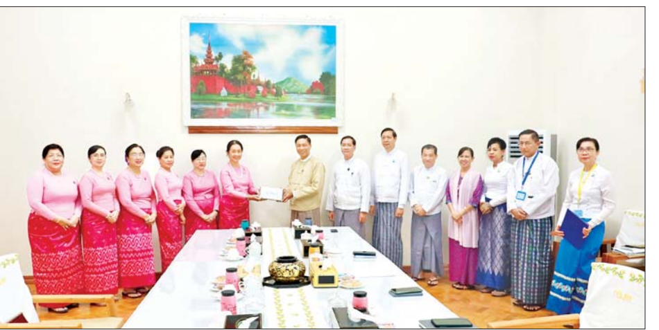
ကော်မတီနှင့် ကျန်းမာရေးဝန်ကြီးဌာန၊ လူမှုဝန်ထမ်း၊ ဆေးနှင့် ဆေးပစ္စည်းများကို ဇူလိုင် ၃ ရက်က ကယ်ဆယ်ရေးနှင့် ပြန်လည်နေရာချထားရေးဝန်ကြီး ဌာနတို့က ထောက်ပံ့သော တာပေါ်လင်လိပ်များ၊ အဝတ်အထည်များ၊ ဆက်သွယ်ရေးပစ္စည်းများ၊ သိရသည်။

အမျိုးသမီးများနှင့် ကလေးသူငယ်များဘဝမြှင့်တင်ရေး အသင်းဥက္ကဋ္ဌနှင့် အဖွဲ့ဝင်များ တက်ရောက်ကြသည်။ အခမ်းအနားတွင် မြန်မာနိုင်ငံအမျိုးသမီးများ နှင့် ကလေးသူငယ်များဘဝ မြှင့်တင်ရေးအသင်း ဥက္ကဋ္ဌ ဒေါက်တာဝေဝေသကာ လှူဒါန်းရခြင်းနှင့် စပ်လျဉ်း၍ ရှင်းလင်းပြောကြားပြီး ပြည်ထောင်စု ဝန်ကြီး ဒေါက်တာစိုးဝင်းက ကချင်ပြည်နယ် ရေကြီး ရေလျှံမှုတွင် စီမံခန့်ခွဲဆောင်ရွက်နေမှုများကို ပြောကြားကာ လှူဒါန်းငွေကျပ် သိန်း ၃၀ ကို လက်ခံ ရယူကာ ဂုဏ်ပြုမှတ်တမ်းလွှာ ပေးအပ်သည်။ အလားတူ မြန်မာနိုင်ငံဆန်စပါးအသင်းချုပ် ဥက္ကဋ္ဌက ငါးသေတ္တာဘူး ၁၇၅၀၀ ပေးပို့လှူဒါန်းမှုနှင့် အမျိုးသားသဘာဝဘေးအန္တရာယ်ဆိုင်ရာ စီမံခန့်ခွဲမှု