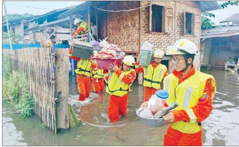
မြစ်ကြီးနားမြို့ရေကြီးမှုဖြစ်စဉ်၌ ပြည်သူများအား ကူညီကယ်ဆယ် ရွှေ့ပြောင်းပေးနေသည့် ပရဟိတအဖွဲ့အား တွေ့ရစဉ်။

ရန်ကုန် ဇူလိုင် ၄ မြန်မာနိုင်ငံအတွင်း ရေကြီးရေလျှံမှုများ ဆက်လက်ဖြစ်ပေါ်လာပါက ချိတ်ဆက်ကူညီခြင်း၊ ကိုယ်တိုင်ကူညီခြင်းများ လုပ်နိုင်ရန် ပရဟိတအသင်းများ ဆောင်ရွက်နေကြောင်း သိရသည်။