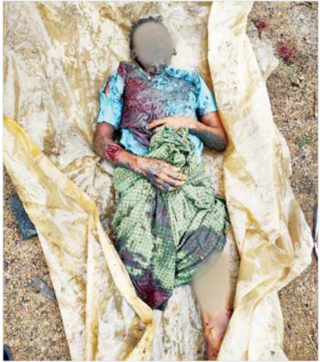
အကြမ်းဖက်သောင်းကျန်းသူများက လားရှိုးမြို့အတွင်းသို့ ရှော့တိုက်ခွဲများဖြင့် ပစ်ခတ်တိုက်ခိုက်ခဲ့မှုကြောင့် ဒေသခံပြည်သူအချို့ သေဆုံး၊ ဒဏ်ရာရရှိမှု မှတ်တမ်းဓာတ်ပုံ။

ထို့ပြင် အကြမ်းဖက်သောင်းကျန်းသူများသည် နံနက် ၁၁ နာရီခန့်တွင် ရှော့တိုက်ခွဲများဖြင့် ပစ်ခတ်ခဲ့ရာ လားရှိုးမြို့ ရပ်ကွက် (၉) နယ်မြေ (၂) အတွင်းရှိ အမှတ် (၁၅) အခြေခံပညာမူလတန်း(လွန်)ကျောင်းပေါ်သို့ ကျရောက်ပေါက်ကွဲခဲ့ပြီး စာသင်ဆောင်များ ထိခိုက်ပျက်စီးသွားခဲ့ကြောင်း သိရသည်။ အကြမ်းဖက်သောင်းကျန်းသူများသည် လားရှိုး