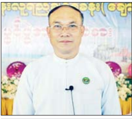
လူမှုရေးရာဝန်ကြီး ဦးခင်မောင်ကြည်

ချောင်းသာ ဧပြီ ၂၉ ဧရာဝတီတိုင်းဒေသကြီး ချောင်းသာမြို့ လူရည်ချွန်စခန်း (ချောင်းသာ) ၌ မြန်မာတစ်နိုင်ငံလုံးမှ ၂၀၂၃-၂၀၂၄ ပညာ သင်နှစ် ဒွါဒသမတန်း လူရည်ချွန် မောင်မယ် ၁၃၇ ဦးနှင့် ကြီးကြပ်ဆရာ ဆရာမများသည် ဧပြီ ၂၇ရက်မှ မေ ၁ ရက်အထိ ယာယီစခန်းချ၍ လူရည်ချွန် ဟောင်းကြီးများနှင့် ရင်းနှီးနှေးနှေးစွာ တွေ့ဆုံခြင်း၊ ဒေသန္တရဗဟုသုတများ လေ့လာခြင်း၊ ကမ်းခြေတွင်အပန်းဖြေခြင်း တို့ကို ဆောင်ရွက်လျက်ရှိသည်။ အဆိုပါ လူရည်ချွန်စခန်းတွင် ရောက်ရှိနေသည့် လူရည်ချွန်စခန်း (ချောင်းသာ)မှ တာဝန်ရှိသူများ၊ လူရည် ချွန်ကြီးများနှင့် ၂၀၂၃-၂၀၂၄ ပညာသင်နှစ် ဒွါဒသမတန်း လူရည်ချွန်မောင်မယ်များ၏ ရင်တွင်းစကားသံများကို ပြည်သူများ သိရှိနိုင်ရန်အတွက် ဖော်ပြအပ်ပါသည်။ ဦးခင်မောင်ကြည်(လူမှုရေးရာဝန်ကြီး- တိုင်းဒေသကြီး) ဧရာဝတီတိုင်း ဒေသကြီးမှာ လူရည်ချွန်စခန်းက နှစ်ခုဖွင့်ပါတယ်။ ငွေဆောင်လူရည်ချွန် အပန်းဖြေစခန်းနဲ့ ချောင်းသာလူရည်ချွန် အပန်းဖြေစခန်း ဖြစ်ပါတယ်။ စခန်းဖွင့်လှစ်မိမ့်နဲ့ ၂၇ ရက်နေ့ လူရည်ချွန်မောင်မယ်တွေ ရောက်လာတယ်။ ၃၀ ရက်အထိက ဒီမှာနေထိုင်ပြီးတော့မှ အပန်းဖြေကြ မှာဖြစ်ပါတယ်။ သူတို့သွားရောက်ပြီး တော့မှ လေ့လာစရာရှိတဲ့နေရာတွေကို လေ့လာကြမှာဖြစ်ပါတယ်။ မေ ၁ ရက် နေ့မှာတော့ ငွေဆောင်၊ ချောင်းသာ စခန်းနှစ်ခုကနေပြီးတော့မှ ပြန်လည် ထွက်ခွာမှာဖြစ်ပါတယ်။ စခန်းချနေထိုင် တဲ့ရက်တွေမှာ ချောင်းသာစခန်း၊