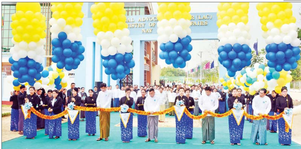
ဥပဒေအသိပညာ ပြန့်ပွားရေးသင်တန်းကျောင်းမူဒီဇိုင်းကို ကောင်စီတွဲဖက်အတွင်းရေးမှူး ဒုတိယဗိုလ်ချုပ်ကြီး ရဲဝင်းဦး၊ ကောင်စီဝင်များဖြစ်ကြသည့် ဗိုလ်ချုပ်ကြီးမြထွန်းဦးနှင့် ဗိုလ်ချုပ်ကြီးတင်အောင်စန်း၊ ဥပဒေရေးရာဝန်ကြီးဌာန ပြည်ထောင်စုဝန်ကြီးနှင့် ပြည်ထောင်စုရှေ့နေချုပ် ဒေါက်တာ သီတာဦးနှင့် ဆောက်လုပ်ရေးဝန်ကြီးဌာန ပြည်ထောင်စုဝန်ကြီး ဦးမျိုးသန့်တို့က ဖဲကြိုးဖြတ်ဖွင့်လှစ်ပေးစဉ်။

“ မိမိတို့နိုင်ငံသည် စစ်မှန်၍ စည်းကမ်းပြည့်ဝသော ပါတီစုံ ဒီမိုကရေစီစနစ် ခိုင်မာစေရေးနှင့် ဒီမိုကရေစီနှင့် ဖက်ဒရယ်စနစ်ကို အခြေခံသည့် ပြည်ထောင်စုကို တည်ဆောက်နေခြင်းဖြစ်သဖြင့် ဥပဒေကို နိုင်ငံသားတိုင်း သိရှိနားလည်လိုက်နာရန် လိုအပ်ပြီး ဥပဒေပညာရပ်များကို ကျယ်ပြန့်စွာ သင်ကြားပေးနိုင်ရေးနှင့် အသိပညာပေးရေးသည်လည်း အရေးကြီးသည့်အခန်းကဏ္ဍမှပါဝင် ”