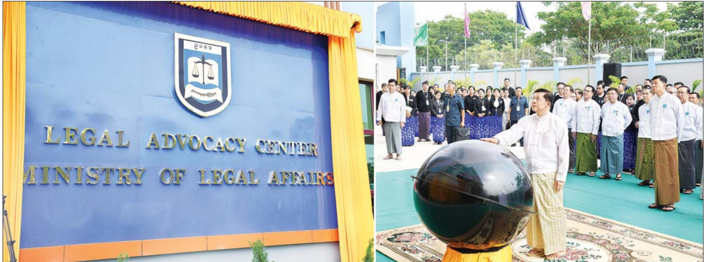
နိုင်ငံတော်စီမံအုပ်ချုပ်ရေးကောင်စီဥက္ကဋ္ဌ နိုင်ငံတော်ဝန်ကြီးချုပ် ဗိုလ်ချုပ်မှူးကြီး မင်းအောင်လှိုင် ဥပဒေအသိပညာ ပြန့်ပွားရေးသင်တန်းကျောင်း LEGAL ADVOCACY CENTER (LAC) ကို စက်ခလုတ်နှိပ် ဖွင့်လှစ်ပေးစဉ်။