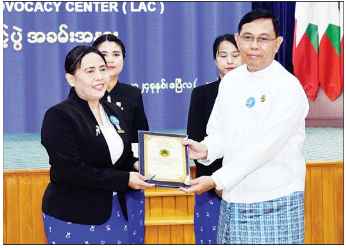
ဆောက်လုပ်ရေးဝန်ကြီးဌာန ပြည်ထောင်စုဝန်ကြီး ဦးမျိုးသန့် အဆောက်အအုံနှင့် သက်ဆိုင်သည့် လွှဲပြောင်းမှုတမ်းစာအုပ်ကို ဥပဒေရေးရာဝန်ကြီးဌာန ပြည်ထောင်စုဝန်ကြီးနှင့် ပြည်ထောင်စုရှေ့နေချုပ် ဒေါက်တာ သီတာဦး ထံ လွှဲပြောင်းပေးအပ်စဉ်။

တည်ငြိမ်အေးချမ်းရေး၊ တရားဥပဒေစိုးမိုးရေးနှင့် လူမှုစီးပွားဘဝ ဖွံ့ဖြိုးတိုးတက်ရေးတို့အတွက် ဥပဒေ အသိပညာရှိကြရန် လိုအပ်သကဲ့သို့ အုပ်ချုပ်ရေးပိုင်း ဆိုင်ရာများ ဆောင်ရွက်ရာတွင်လည်း စီမံခန့်ခွဲမှု ဆောင်ရွက်သူများအနေဖြင့် ဥပဒေကိုနားလည် တတ်ကျွမ်းပြီး လေးစားလိုက်နာကြရန် လိုအပ် ကြောင်း၊ သို့မှသာ မိမိတို့လိုက်ဆောင်ရွက်မှုများ သည် အမှားအယွင်းနှင့် အပြစ်ကင်းစင်ပြီး အကျိုးရှိ မှန်ကန်ထိရောက်သည့် လုပ်ရပ်များနှင့် နိုင်ငံနှင့် ပြည်သူအတွက် ကောင်းကျိုးရလဒ်များကို ဖော်ဆောင် ဖြစ်နိုင်မည်ဖြစ်ကြောင်း၊ ထို့ကြောင့် ဝိဇ္ဇာ/သိပ္ပံ တက္ကသိုလ်အသီးသီးတွင် ဝိဇ္ဇာ(ဥပဒေ) ပညာဘွဲ့ B.A(Law) ပညာသင်ကြားနေပြီး အဓိကကျသည့် တက္ကသိုလ်များတွင် ဥပဒေဘွဲ့ (LLB) ပညာသင်ကြား ပေးနေကြောင်း၊ ယခုထက်လည်း ကျယ်ကျယ်ပြန့်ပြန့် ဖြစ်အောင် ကြိုးစားဆောင်ရွက်ရမည်ဖြစ်ကြောင်း၊ မြန်မာနိုင်ငံမှ မွေးထုတ်ပေးလိုက်သည့် ဥပဒေပညာ ရှင်များသည် နိုင်ငံတကာတွင် ရင်ဆိုင်ယှဉ်ပြိုင်နိုင် သည့် အကျော်ဇောယူများဖြစ်သည်အထိ လုပ်ဆောင် ကြရန် တိုက်တွန်းလိုကြောင်း။ စာမျက်နှာ ၅ သို့