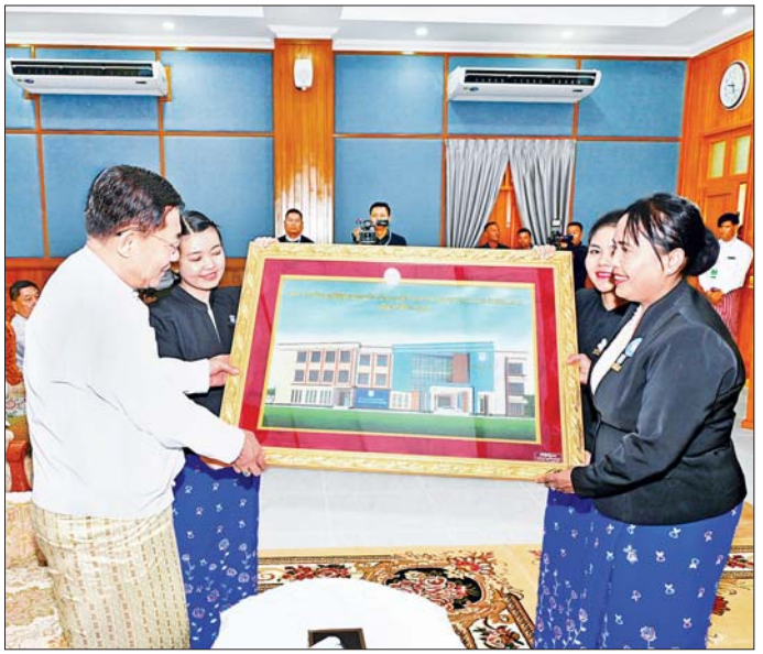
နိုင်ငံတော်စီမံအုပ်ချုပ်ရေးကောင်စီဥက္ကဋ္ဌ နိုင်ငံတော်ဝန်ကြီးချုပ် ဗိုလ်ချုပ်မှူးကြီး မင်းအောင်လှိုင် ထံ ပြည်ထောင်စုဝန်ကြီးနှင့် ပြည်ထောင်စုရှေ့နေချုပ် ဒေါက်တာ သီတာဦး က ဥပဒေအသိပညာပြန့်ပွားရေး သင်တန်းကျောင်းဖွင့်ပွဲအထိမ်းအမှတ် လက်ဆောင်အား ဂါရဝပြုပေးအပ်စဉ်။

မိမိတို့နိုင်ငံသည် စစ်မှန်၍စည်းကမ်းပြည့်ဝသော ပါတီဒီမိုကရေစီစနစ် နှင့် ဖက်ဒရယ်စနစ်ကို အခြေခံသည့် ပြည်ထောင်စု ကို တည်ဆောက်နေခြင်းဖြစ်သဖြင့် ဥပဒေကို နိုင်ငံ သားတိုင်း သိရှိနားလည်လိုက်နာရန် လိုအပ်ပြီး ဥပဒေပညာရပ်များကို ကျယ်ပြန့်စွာသင်ကြားပေး နိုင်ရေးနှင့် အသိပညာပေးရေးသည်လည်း အရေးကြီး သည့်အခန်းကဏ္ဍမှ ပါဝင်နေကြောင်း၊ လူတိုင်း လူတိုင်း ဥပဒေပညာရှင် မဖြစ်နိုင်သော်လည်း ဥပဒေ ပညာကို သိရှိနားလည်ထားမှသာ လူမှုဘဝဖြင့်တင်မှု များတွင် အကျိုးရှိစွာ အသုံးပြုနိုင်မည်ဖြစ်ကြောင်း၊ နိုင်ငံတော်၏ အခြေခံလိုအပ်ချက်ဖြစ်သည့်