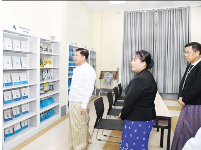
နိုင်ငံတော်စီမံအုပ်ချုပ်ရေးကောင်စီဥက္ကဋ္ဌ နိုင်ငံတော်ဝန်ကြီးချုပ် ဗိုလ်ချုပ်မှူးကြီး မင်းအောင်လှိုင် ဥပဒေအသိပညာ ပြန့်ပွားရေးသင်တန်းကျောင်းအတွင်း လှည့်လည်ကြည့်ရှုစဉ်။