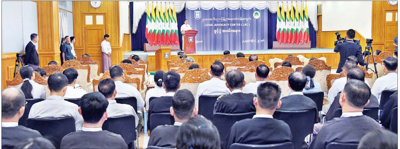
နိုင်ငံတော်စီမံအုပ်ချုပ်ရေးကောင်စီဥက္ကဋ္ဌ နိုင်ငံတော်ဝန်ကြီးချုပ် ဗိုလ်ချုပ်မှူးကြီး မင်းအောင်လှိုင် ဥပဒေရေးရာဝန်ကြီးဌာန၊ ဥပဒေအသိပညာပြန့်ပွားရေး သင်တန်းကျောင်း LEGAL ADVOCACY CENTER (LAC) ဖွင့်ပွဲ အခမ်းအနားတွင် အမှာစကားပြောကြားစဉ်။