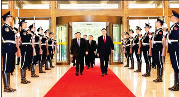
နိုင်ငံတော်စီမံအုပ်ချုပ်ရေးကောင်စီအဖွဲ့ဝင်၊ ပြည်ထောင်စုဝန်ကြီး ဒုတိယဗိုလ်ချုပ်ကြီး ရာပြည့် ဦးဆောင်သော ကိုယ်စားလှယ်အဖွဲ့အား ကွမ်တုံးပြည်နယ် ဒုတိယရဲတပ်ဖွဲ့မှူး မစ္စတာ ဟွမ်ဂွေဟွေ (Mr. Huang Guohui) ဦးဆောင်သော အဖွဲ့က ကြိုဆိုစဉ်။