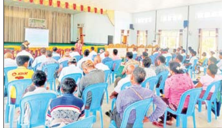
တံတားဦးမြို့နယ်၌ ဆီထွက်သီးနှံအထွက်နှုန်းတိုးတက်ရေး နည်းပညာပေးဆွေးနွေးပွဲကျင်းပ

လုပ်ငန်းများ တိုးတက်မှုနှင့် အလုပ်အကိုင် အခွင့်အလမ်း ဖန်တီးပေးနိုင်မှုပေါ်လစဉ်ဆန်းစစ် လေ့လာသုံးသပ်တင်ပြပေးရမည် ဖြစ်ကြောင်း ပြောကြားသည်။ ထို့နောက် ပဲခူးတိုင်းဒေသ ကြီး ရင်းနှီးမြှုပ်နှံမှုကော်မတီ ခေတ္တအတွင်းရေးမှူးက ဖက်စပ် နိုင်ငံခြားရင်းနှီးမြှုပ်နှံမှု လုပ်ငန်း သစ်တစ်ခုနှင့် တည်ရှိပြီးသား နိုင်ငံခြားရင်းနှီးမြှုပ်နှံမှု လုပ်ငန်း တိုးတက်ထုတ်လုပ်မည့် စီမံချက် များအား ပါဝါပွိုင့်ဖြင့် ရှင်းလင်း တင်ပြရာ တက်ရောက်လာသည့် တိုင်းဒေသကြီး ရင်းနှီးမြှုပ်နှံမှု ကော်မတီဝင်များက အကြံပြု ဖြည့်စွက်တင်ပြခဲ့ပေမယ့် တိုင်းဒေသ ကြီး ဝန်ကြီးချုပ်က ဥပဒေ၊ လုပ်ထုံး လုပ်နည်းများနှင့်အညီ ဆောင် ရွက်ပေးခဲ့ကြောင်း သိရှိရသည်။ အဆိုပါလုပ်ငန်းများ၏ တင်ပြ ချက်များအရ ဧပြီလတွင် ပဲခူးတိုင်း ဒေသကြီးအတွင်းသို့ ဖက်စပ် နိုင်ငံခြား ရင်းနှီးမြှုပ်နှံမှုပမာဏ အမေရိကန်ဒေါ်လာတစ်သန်းနှင့် ဒေသတွင်း အလုပ်အကိုင် အခွင့် အလမ်း ၆၀ ဦး ဖန်တီးပေးနိုင်မည် ဖြစ်ကြောင်း သိရသည်။ တိုင်းဒေသကြီး (ပြန်/ဆက်)