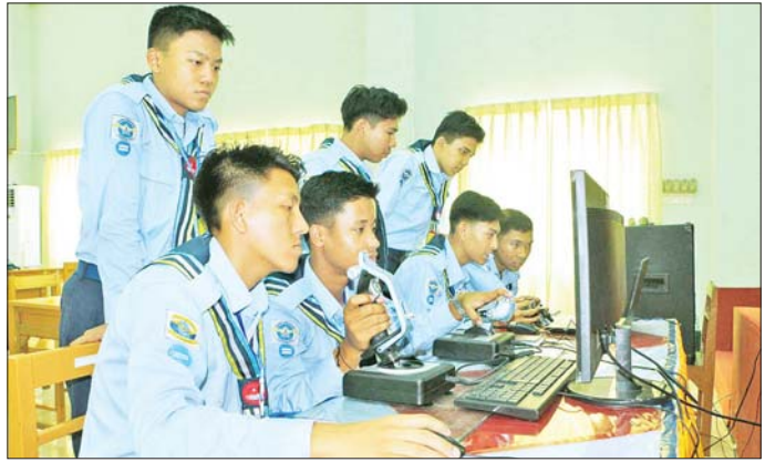
လေကြောင်းလူငယ် သင်တန်းသားများ ဘာသာရပ်အလိုက် သင်ကြားစဉ်။