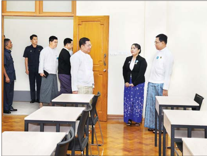
နိုင်ငံတော်စီမံအုပ်ချုပ်ရေးကောင်စီဥက္ကဋ္ဌ နိုင်ငံတော်ဝန်ကြီးချုပ် ဗိုလ်ချုပ်မှူးကြီး မင်းအောင်လှိုင် ဥပဒေအသိပညာ ပြန့်ပွားရေးသင်တန်းကျောင်းအတွင်း လှည့်လည်ကြည့်ရှုစဉ်။