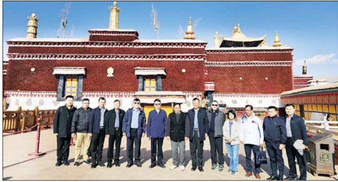
နိုင်ငံတော်စီမံအုပ်ချုပ်ရေးကောင်စီအဖွဲ့ဝင်၊ ပြည်ထောင်စုဝန်ကြီး ဒုတိယဗိုလ်ချုပ်ကြီး ရာပြည့် ဦးဆောင်သော ကိုယ်စားလှယ်အဖွဲ့ တရုတ်ပြည်သူ့သမ္မတနိုင်ငံ၊ တိဗက်ကိုယ်ပိုင်အုပ်ချုပ်ခွင့်ရဒေသရှိ UNESCO စာရင်းဝင် အထင်ကရ နေရာတစ်ခုဖြစ်သည့် Potala Palace သို့ သွားရောက်လေ့လာစဉ်။

ကိုယ်စားလှယ်အဖွဲ့နှင့် တွေ့ဆုံပြီး အွန်လိုင်းလိမ်လည်မှုလုပ်ငန်းများ ပပျောက်ရေး၊ နိုင်ငံပြတ်ကျော် မှုခင်းများကို ပူးပေါင်းတိုက်ဖျက် ရေး၊ နယ်စပ်နေပြည်သူများ ဘေးကင်းလုံခြုံရေး၊ နှစ်နိုင်ငံ ဝန်ကြီးဌာနနှစ်ခုအကြား ဝန်ကြီး အဆင့် သဘောတူညီချက်များ အပေါ် ဆက်လက်အကောင် အထည်ဖော်ရေးဆိုင်ရာ ကိစ္စရပ် များ၊ နှစ်နိုင်ငံချစ်ကြည်ရင်းနှီးစွာ အပြန်အလှန် ဆက်ဆံနိုင်ရေး ဆိုင်ရာ ကိစ္စရပ်များကို ဆွေးနွေး ခဲ့ကြကာ မြန်မာကိုယ်စားလှယ် အဖွဲ့သည် ကျူးမြစ်အတွင်း လှည့်လည်လေ့လာခဲ့ကြသည်။ နိုင်ငံတော် စီမံအုပ်ချုပ်ရေး ကောင်စီအဖွဲ့ဝင်၊ ပြည်ထောင်စု ဝန်ကြီး ဦးဆောင်သော မြန်မာ ကိုယ်စားလှယ်အဖွဲ့၏ တရုတ် နိုင်ငံသို့ သွားရောက်ခဲ့သည့် အလုပ် သဘောခရီးစဉ်အတွင်း နှစ်နိုင်ငံ ပူးပေါင်း ဆောင်ရွက်ရေးနှင့် နှစ်နိုင်ငံဝန်ကြီးဌာနနှစ်ခုအကြား ပူးပေါင်းဆောင်ရွက်မှုများအပေါ် အပြုသဘောဆောင်သည့် ရလဒ် များကို ရရှိခဲ့ကြောင်း သိရသည်။