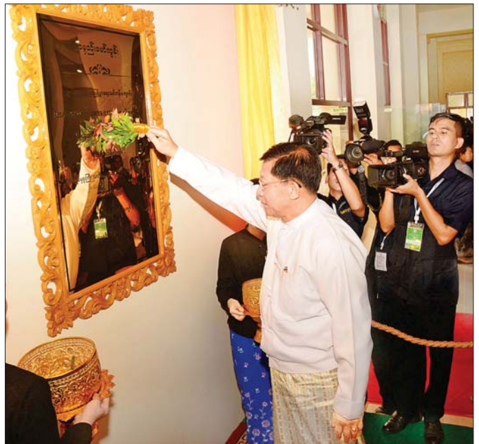
နိုင်ငံတော်စီမံအုပ်ချုပ်ရေးကောင်စီဥက္ကဋ္ဌ နိုင်ငံတော်ဝန်ကြီးချုပ် ဗိုလ်ချုပ်မှူးကြီး မင်းအောင်လှိုင် သင်တန်းကျောင်း ကမ္ဘာ့ပေါင်းမော်ကွန်းကို အမွှေးနံ့သာရည်များ ပတ်ဖျန်းပေးစဉ်။