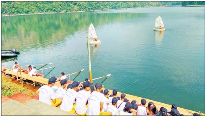
ရေကြောင်းလူငယ် သင်တန်းသား သင်တန်းသူများအား နည်းပြများက သင်ကြားပေးစဉ်။

စခန်းတန်းခွဲ(၁) ရေကြောင်းလူငယ်စခန်းမှ သင်တန်းသား သင်တန်းသူ ၅၉ ဦး၊ နေပြည်တော်စခန်းတန်းခွဲ(၂) ရေကြောင်းလူငယ်စခန်းမှ သင်တန်းသား သင်တန်းသူ ၁၂၂ ဦး၊ ရန်ကုန်တိုင်းဒေသကြီးရှိ အင်းယား ရေကြောင်းလူငယ်စခန်းမှ သင်တန်းသား သင်တန်းသူ ၉၇ ဦး၊ ကိုကိုးကျွန်းမြို့ရှိ ရေကြောင်းလူငယ်စခန်းမှ သင်တန်းသား သင်တန်းသူ ၄၃ ဦး၊ ဧရာဝတီတိုင်းဒေသကြီး ဟိုင်းကြီးကျွန်းမြို့ရှိ ရေကြောင်းလူငယ်စခန်းမှ သင်တန်းသား သင်တန်းသူ ၁၅၅ ဦး၊ မွန်ပြည်နယ် မော်လမြိုင်မြို့ရှိ ရေကြောင်းလူငယ်စခန်းမှ သင်တန်းသား သင်တန်းသူ ၇၀၊ တနင်္သာရီတိုင်းဒေသကြီး ဟိုင်းဇဲဒေသရှိ ရေကြောင်းလူငယ်စခန်းမှ သင်တန်းသား သင်တန်းသူ ၆၀၊ မြိတ်မြို့ရှိ ရေကြောင်းလူငယ်စခန်းမှ သင်တန်းသား သင်တန်းသူ ၅၄ ဦး၊ ကျွန်းစုမြို့ရှိ ရေကြောင်းလူငယ်စခန်းမှ သင်တန်းသား သင်တန်းသူ ၅၅ ဦး၊ မန္တလေးတိုင်းဒေသကြီး မန္တလေးမြို့ရှိ ရေကြောင်းလူငယ်စခန်းမှ သင်တန်းသား သင်တန်းသူ ၆၁ ဦးနှင့် ရှမ်းပြည်နယ် ကျိုင်းတုံမြို့ရှိ ရေကြောင်းလူငယ်စခန်းမှ သင်တန်း