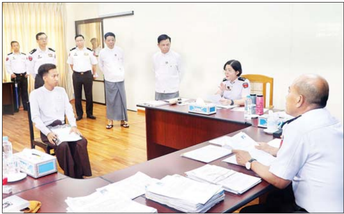
ခြင်းတို့ကို ဧပြီ ၂၉ ရက်နှင့် ၃၀ ရက်တို့တွင် နေပြည်တော်(ရုံးချုပ်) ၌ ကျင်းပဆောင်ရွက်ခြင်းဖြစ်ပြီး မြင်းတိုက် ဧပြီ ၂၉ ရက်နှင့် ၃၀ ရက်တို့တွင် နေပြည်တော်(ရုံးချုပ်) ၌ ကျင်းပဆောင်ရွက်ခြင်းဖြစ်ပြီး စစ်ဆေးမှု အောင်မြင်သူများကို စစ်ဆေးမှု အောင်မြင်သူများကို ရွက်သွားမည်ဖြစ်ကြောင်း သိရ သည်။ ဝန်ထမ်းခန့်ထားရေး လုပ်ငန်းစဉ် များအတိုင်း ဆက်လက်ဆောင် သတင်းစဉ်

များကို အင်ပြည့်အားပြည့် ဆောင်ရွက်နိုင်ရေးအတွက် ဌာန၌ လစ်လပ်လျက်ရှိသည့် ဝန်ထမ်း များဖြည့်တင်းနိုင်ရန် လက်ထောက် လှုပ်မှုကြီးကြပ်ရေးမှူး ရာထူး အတွက် အမျိုးသား ၁၂၀၊ အမျိုးသမီး ၃၀ စုစုပေါင်း ၁၅၀ ခန့်ထားနိုင်ရန် တစ်နိုင်ငံလုံး အတိုင်းအတာဖြင့် ဝန်ထမ်း လျှောက်လွှာများ ခေါ်ယူ၍ သတ်မှတ်ချက်များနှင့် ကိုက်ညီ သူများကို မတ် ၁၆ ရက်က သက်ဆိုင်ရာ တိုင်းဒေသကြီး/ ပြည်နယ်အသီးသီး၌ အင်္ဂလိပ်စာ ရေးဖြေစာမေးပွဲများ ကျင်းပခဲ့ရာ အဆိုပါ ရေးဖြေစာမေးပွဲအောင်မြင် ကြသူများကို ကွန်ပျူတာစစ်ဆေး ခြင်းနှင့် လူတွေ့နှုတ်ဖြေ စစ်ဆေး