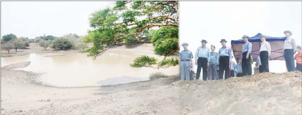
ပြည်ထောင်စုဝန်ကြီး ဒုတိယဗိုလ်ချုပ်ကြီး ထွန်းထွန်းနောင်နှင့်အဖွဲ့ ပုဂံကမ္ဘာ့အမွေအနှစ်ဒေသရှိ ရှေးဟောင်းရေကန်များ တူးဖော်ထိန်းသိမ်းမှု အခြေအနေကို ကြည့်ရှုစစ်ဆေးစဉ်။

နေပြည်တော် ဧပြီ ၂၉ နယ်စပ်ရေးရာဝန်ကြီးဌာန ပြည်ထောင်စုဝန်ကြီး ဒုတိယဗိုလ်ချုပ်ကြီး ထွန်းထွန်းနောင်၊ သာသနာရေးနှင့် ယဉ်ကျေးမှုဝန်ကြီးဌာန ပြည်ထောင်စုဝန်ကြီး ဦးတင်ဦးလွင်၊ စိုက်ပျိုးရေး၊ မွေးမြူရေးနှင့် ဆည်မြောင်းဝန်ကြီးဌာန ပြည်ထောင်စုဝန်ကြီး ဦးမင်းနောင်၊ မန္တလေးတိုင်းဒေသကြီး ဝန်ကြီးချုပ် ဦးမျိုးအောင်တို့သည် ယနေ့နံနက်ပိုင်းတွင် မန္တလေးတိုင်းဒေသကြီး ပုဂံယဉ်ကျေးမှု အမွေအနှစ်ဒေသ၌ နိုင်ငံတော်အကြီးအကဲ၏ ခရီးစဉ်လမ်းညွှန်ချက်ပါ ဆောင်ရွက်ထားရှိမှုများကို ကြည့်ရှုစစ်ဆေးပြီး ရှေးဟောင်းရေကန်များ တူးဖော်ပြုပြင် ထိန်းသိမ်းခြင်းနှင့် ပုဂံမြို့ဟောင်းကျုံးတူးဖော် ထိန်းသိမ်းမှု အခြေအနေများကို လှည့်လည်ကြည့်ရှုစစ်ဆေးသည်။