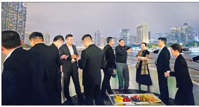
နိုင်ငံတော်စီမံအုပ်ချုပ်ရေးကောင်စီအဖွဲ့ဝင်၊ ပြည်ထောင်စုဝန်ကြီး ဒုတိယဗိုလ်ချုပ်ကြီး ရာပြည့် ဦးဆောင်သော ကိုယ်စားလှယ်အဖွဲ့ ကျူးမြစ်အတွင်း လှည့်လည်လေ့လာစဉ်။