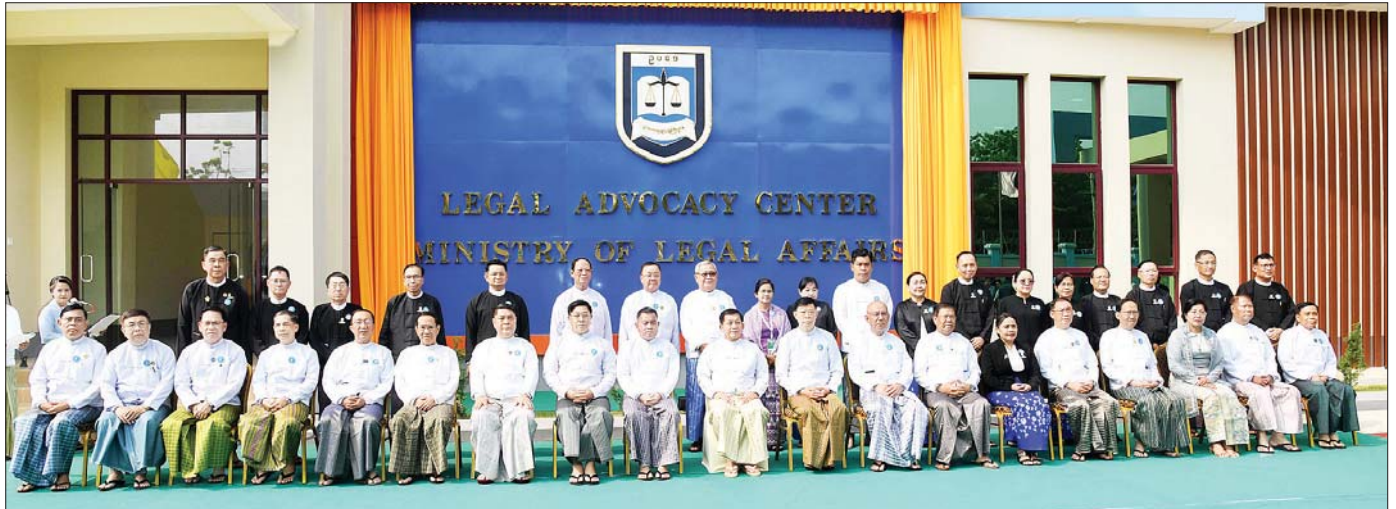
နိုင်ငံတော်စီမံအုပ်ချုပ်ရေးကောင်စီဥက္ကဋ္ဌ နိုင်ငံတော်ဝန်ကြီးချုပ် ဗိုလ်ချုပ်မှူးကြီး မင်းအောင်လှိုင် အခမ်းအနားတက်ရောက်လာကြသူများနှင့်အတူ စုပေါင်းမှတ်တမ်းတင် ဓာတ်ပုံရိုက်စဉ်။