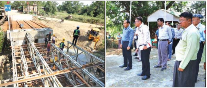
စစ်ကိုင်းတိုင်းဒေသကြီး ဝန်ကြီးချုပ် ဦးမြတ်ကျော် ဟုမ္မလင်း၊ ညောင်ပင်သာ၊ မြောက်ကုန်း၊ ဗျူဟာ ဆက်လမ်းပေါ်ရှိ အာရ်စီစီ ကွန်ကရစ်တံတားတည်ဆောက်ရေးလုပ်ငန်းခွင်အား ကြည့်ရှုစစ်ဆေး

ပါကြောင်း၊ လုပ်ငန်းများ ဆောင်ရွက်ရာတွင် မိမိတို့ တာဝန်ယူဆောင်ရွက်နေမှုများအပေါ် စေတနာထား ကာ ဆောင်ရွက်သွားကြရန် လိုအပ်ပါကြောင်း၊ တည်ဆောက်ရေးကုန်ကြမ်းများ လုပ်ငန်းခွင်အတွင်း အချိန်မီရောက်ရှိရေး မိမိတို့ တိုင်းဒေသကြီးအစိုးရ အဖွဲ့အနေဖြင့် တာဝန်ရှိသူများနှင့် ပေါင်းစပ် ပြည့်ဆည်းဆောင်ရွက်ပေးသွားမည် ဖြစ်ပါကြောင်း၊ လုပ်ငန်းခွင်ဘေးအန္တရာယ်ကင်းရှင်းရေးနှင့် လုံခြုံရေး ဆိုင်ရာများကို အလေးထားဆောင်ရွက်သွားကြရန် လိုအပ်ကြောင်း အသေးစိတ်မှာကြားကာ ရှင်းလင်း တင်ပြချက်များအပေါ် လိုအပ်သည်များကို တာဝန် ရှိသူများနှင့် ပြည့်ဆည်းပေါင်းစပ် ဆောင်ရွက်ပေးခဲ့ သည်။ ဆက်လက်၍ တိုင်းဒေသကြီး ဝန်ကြီးချုပ်နှင့် တာဝန်ရှိသူများက နှစ်ပတ်အသေးစားရေအား လျှပ်စစ်စီမံကိန်း တည်ဆောက်ရေးလုပ်ငန်းခွင် အတွင်း၌ ဆောင်ရွက်နေသည့် ပင်မတာဝန်ကရစ် သွန်းလောင်းနေမှုနှင့် ရေယူအဆောက်အအုံ တည်ဆောက်နေမှုလုပ်ငန်းများကို လိုက်လံရှင်းလင်း ကြည့်ရှုစစ်ဆေးသည်။ အဆိုပါ နှစ်ပတ် အသေးစားရေအားလျှပ်စစ်စီမံ ကိန်းသည် ဟုမ္မလင်းမြို့၏ အနောက်ဘက် ၇ ဒသမ ၅ မိုင်ခန့်အကွာ နားသကျိုက်ကျေးရွာအနီးတွင် တည်ရှိ၍ Concrete Gravity Dam တစ်ခုအမျိုး အစားဖြစ်ပြီး တပ်ဆင်စက်အင်အား ၆ မဂ္ဂါဝပ်