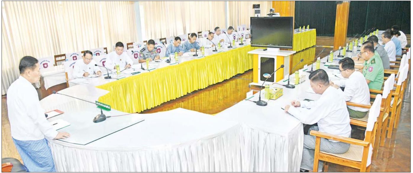
နိုင်ငံတော်စီမံအုပ်ချုပ်ရေးကောင်စီ ဒုတိယဥက္ကဋ္ဌ ဒုတိယတပ်မတော်ကာကွယ်ရေး ဦးစီးချုပ် ကာကွယ်ရေးဦးစီးချုပ်(ကြည်း) ဒုတိယဗိုလ်ချုပ်မှူးကြီး စိုးဝင်း ကရင်ပြည်နယ်နှင့် မွန်ပြည်နယ်တို့မှ ဝန်ကြီးချုပ်များနှင့် ဌာနဆိုင်ရာတာဝန်ရှိသူများအား တွေ့ဆုံအမှာစကား ပြောကြားစဉ်။