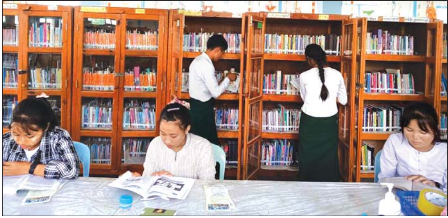
ရမ်းပြည်နယ်(မြောက်ပိုင်း) 'ဝ' ကိုယ်ပိုင်အုပ်ချုပ်ခွင့်ရတိုင်း မက်မန်းခရိုင် ပြန်ကြားရေးနှင့် ပြည်သူ့ဆက်ဆံရေးဦးစီးဌာန ပြည်သူ့စာကြည့်တိုက်၌ ကျောင်းသား ကျောင်းသူများ စာပေလေ့လာဖတ်ရှုနေစဉ်။

အကျင့်အကျင့်ဖြစ်သည်။ မြန်မာလူမျိုးများအနေဖြင့် အနည်းဆုံးတော့ ကိုယ်တတ်နိုင်သည့် ဘက်က အကျိုးရှိမည့်စာအုပ်စာတမ်းများ စာအုပ်ဝယ်ရန်ငွေကြေး စာကြည့်တိုက်ပရိဘောဂများ လှူဒါန်းပေးကမ်းကြခြင်းဖြင့် စာကြည့်တိုက်များကို ရှင်သန်ဖွံ့ဖြိုးစေလိုကြသည်ကို တွေ့ရသည်။ ထိုအချက်ကို နိုင်ငံတော်အကြီးအကဲ၏ “စာကြည့်တိုက်များတွင် ရှိသည့်ရိုယိုက်