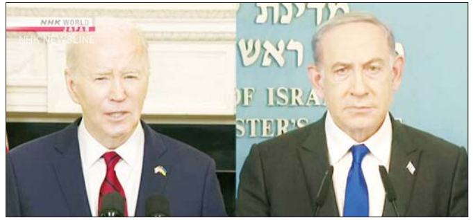
အမေရိကန်သမ္မတ ဘိုင်ဒင်နှင့် အစ္စရေးဝန်ကြီးချုပ် နေတန်ယာဟု