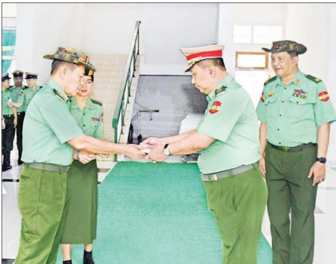
နိုင်ငံတော်စီမံအုပ်ချုပ်ရေးကောင်စီ ဒုတိယဥက္ကဋ္ဌ ဒုတိယတပ်မတော်ကာကွယ်ရေးဦးစီးချုပ် ကာကွယ်ရေးဦးစီးချုပ်(ကြည်း) ဒုတိယဗိုလ်ချုပ်မှူးကြီး စိုးဝင်း ဆေးဝန်ထမ်းတပ်ဖွဲ့ဝင်များအတွက် ဂုဏ်ပြုချီးမြှင့်ငွေများ ပေးအပ်စဉ်။

ကျန်းမာရေးတိုးတက်ကောင်းမွန်မှု အခြေအနေများ ရင်းရင်းနှီးနှီး မေးမြန်းထို့နောက် နိုင်ငံတော်စီမံအုပ်ချုပ်ရေးကောင်စီ ဒုတိယဥက္ကဋ္ဌ ဒုတိယတပ်မတော်ကာကွယ်ရေးဦးစီးချုပ် ကာကွယ်ရေးဦးစီးချုပ်(ကြည်း)နှင့် အဖွဲ့ဝင်များသည် မော်လမြိုင်မြို့ရှိ နယ်မြေခံတပ်မတော်ဆေးရုံတွင် တက်ရောက်ဆေးကုသမှု ခံယူလျက်ရှိသည့် နိုင်ငံတော်ကာကွယ်ရေးနှင့် လုံခြုံရေးတာဝန်များ ထမ်းဆောင်စဉ် ထိခိုက်ဒဏ်ရာရရှိခဲ့သော အရာရှိ စစ်သည်များအား တစ်ဦးချင်းလိုက်လံတွေ့ဆုံ၍ ထိခိုက်ဒဏ်ရာရရှိခဲ့မှု အခြေအနေများ၊ ဆေးဝါးကုသမှု ပေးထားသည့် အခြေအနေများ၊ ရောဂါကုသပျောက်ကင်းသက်သာမှု အခြေအနေများနှင့် ကျန်းမာရေးတိုးတက်ကောင်းမွန်မှု အခြေအနေများကို ရင်းရင်းနှီးနှီး မေးမြန်းကာ အားပေးစကားပြောကြားသည်။ ယင်းနောက် နိုင်ငံတော်စီမံအုပ်ချုပ်ရေးကောင်စီ ဒုတိယဥက္ကဋ္ဌ