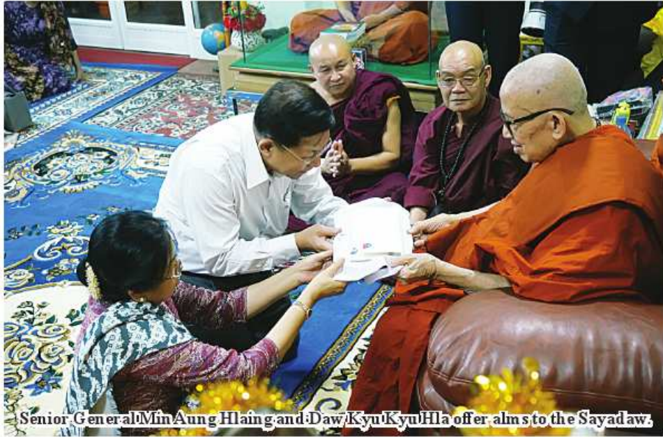
Senior General Min Aung Hlaing and Daw Kyu Kyu Hla offer alms to the Sayadaw.