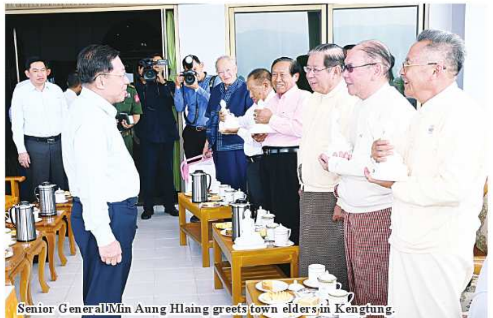
Senior General Min Aung Hlaing greets town elders in Kengtung.