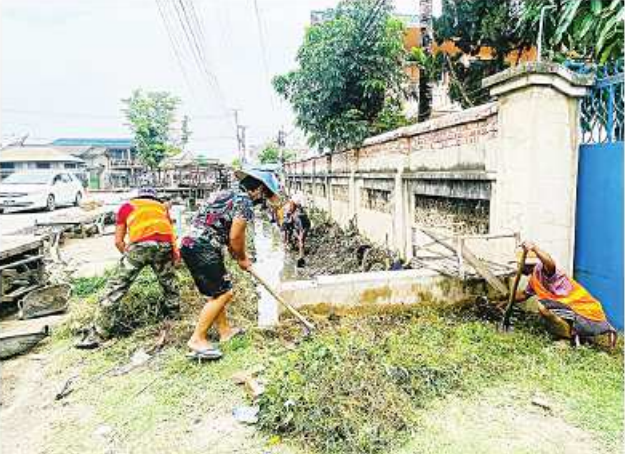
ကျော်စောဦး(မောရမ်းမြေ)

ကျိုင်းတုံမြို့ အမှတ်(၄)ရပ်ကွက် အတွင်းရှိ ရေမြောင်းလုပ်ငန်းများ အနေဖြင့် အရည် ပေ ၄၄၅၀၊ အကျယ် သုံးပေ၊ အမြင့် သုံးပေရှိပြီး လျာထားရန်ပုံငွေကျပ် ၁၂ သန်း ဖြင့် ကျိုင်းတုံမြို့နယ် စည်ပင် သာယာရေးဌာနက မေ ၅ ရက်က စတင်ဆောင်ရွက်လျက်ရှိရာ ယခု အခါ လုပ်ငန်းများ ၈၀ ရာခိုင်နှုန်း ပြီးစီးပြီဖြစ်ကြောင်း၊ အဆိုပါရေ မြောင်းများအတွင်း အမှိုက်နုနုဆယ် ယူခြင်းဆောင်ရွက်ပြီးစီးပါက ရေစီး ရေလာကောင်းမွန်ပြီး မြို့တွင်း ရေကြီးရေလျှံမှုမကာကွယ်ပေးနိုင် မည်ဖြစ်ကြောင်း ကျိုင်းတုံမြို့ နယ် စည်ပင်သာယာရေးဌာနမှ သိရသည်။