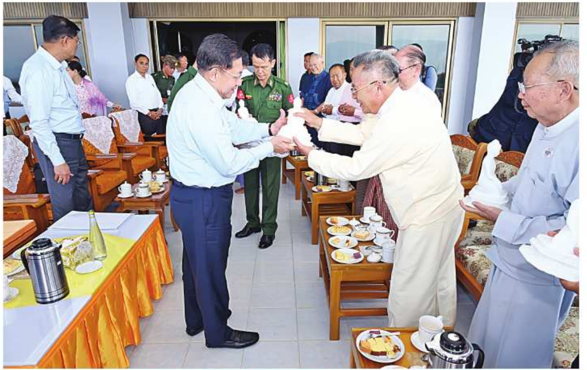
နိုင်ငံတော်စီမံအုပ်ချုပ်ရေးကောင်စီဥက္ကဋ္ဌ နိုင်ငံတော်ဝန်ကြီးချုပ် ဗိုလ်ချုပ်မှူးကြီးမင်းအောင်လှိုင် မြို့မိမြို့ဖများအား မာရဝိဇယဗုဒ္ဓရုပ်ပွားတော်မြတ်ကြီးပုံစံတူ ကျောက်ဆစ်ဗုဒ္ဓရုပ်ပွားတော်မြတ်များကို တစ်ဦးချင်းပေးအပ်စဉ်။

ခရီးသွားလုပ်ငန်းဖွံ့ဖြိုးတိုးတက်ရေး ရှမ်းပြည်နယ်(အရှေ့ပိုင်း) ဒေသ၌ ခရီးသွားလုပ်ငန်း ဖွံ့ဖြိုးတိုးတက်ရေးအတွက် နိုင်ငံတော်က လိုအပ်သည်များကို ဆောင်ရွက်ပေးလျက်ရှိကြောင်း၊ ကျွင်းတုံလေဆိပ်နှင့် တာချီလိတ်လေဆိပ်တို့ကို အဆင့်မြှင့်တင်ခြင်းလုပ်ငန်းများ ဆောင်ရွက်လျက်ရှိပြီး အိမ်နီးနားချင်းနိုင်ငံများမှ လေကြောင်းခရီးစဉ်ဖြင့် ပြည်ပခရီးသွားများ ဝင်ရောက်နိုင်မည်ဖြစ်ကြောင်း၊ ကျွင်းတုံ