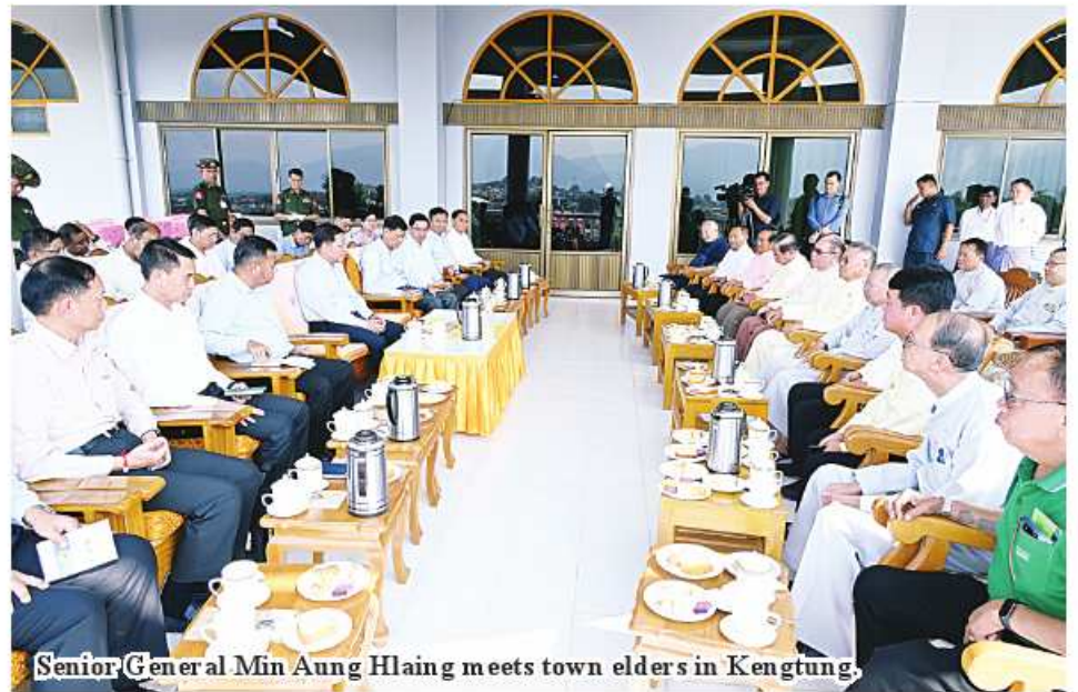
Senior General Min Aung Hlaing meets town elders in Kengtung.

undertakings. The area now has successful production businesses. Hence, the area must strive to produce farm products more and to sup-