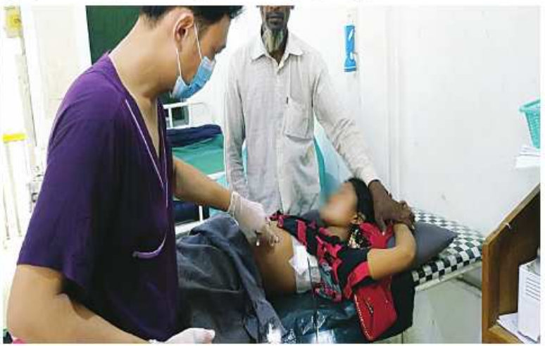
ယာယီနေရပ်စွန့်ခွာသူများနေထိုင်သည့် ဘူးသီးတောင်မြို့ ပြည်သူ့ဆေးရုံဝင်းအတွင်းသို့ AA အကြမ်းဖက်သောင်းကျန်းသူများပစ်ခတ်သည့် လက်နက်ကြီးကျည်ကျရောက်ပေါက်ကွဲမှုကြောင့် ထိခိုက်ဒဏ်ရာရရှိခဲ့သည့် ဒေသခံပြည်သူများအား နယ်မြေစံတပ်မတော်ဆေးရုံတွင် ဆေးဝါးကုသမှုများဆောင်ရွက်ပေးနေစဉ်။

ပေါက်ကွဲခဲ့မှုကြောင့် ပြည်သူ့ဆေးရုံဝင်းအတွင်း အေးချမ်းစွာနေထိုင်လျက်ရှိသော ယာယီနေရပ်စွန့်ခွာ ဒေသခံပြည်သူ သုံးဦးသေဆုံးခဲ့ပြီး အသက် တစ်နှစ်ခွဲနှင့် အသက် ၁၀ နှစ်အရွယ် ကလေးငယ်နှစ်ဦးအပါအဝင် ဒေသခံပြည်သူ ၁၀ ဦး ဗုံးစထိမှန်ဒဏ်ရာများ