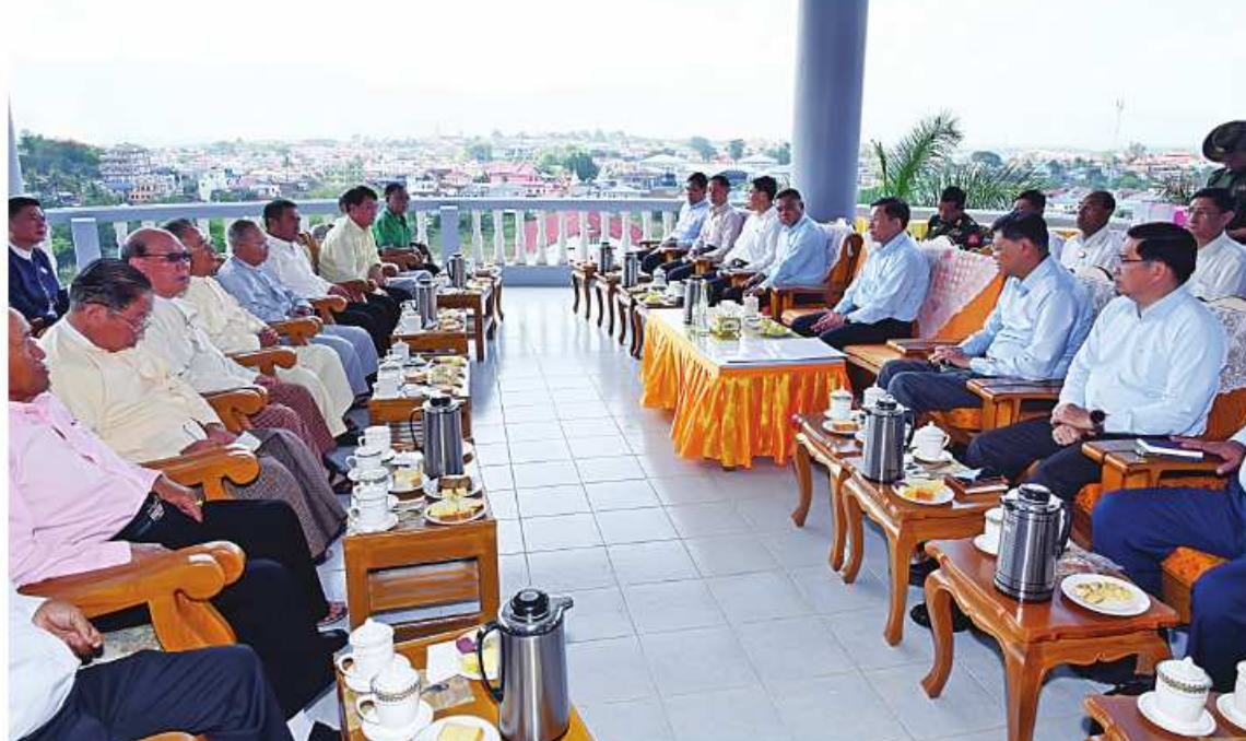
နိုင်ငံတော်စီမံအုပ်ချုပ်ရေးကောင်စီဥက္ကဋ္ဌ နိုင်ငံတော်ဝန်ကြီးချုပ် ဗိုလ်ချုပ်မှူးကြီးမင်းအောင်လှိုင် ကျိုင်းတုံမြို့ရှိ မြို့မိမြို့ဖများအား ရင်းရင်းနှီးနှီးတွေ့ဆုံစဉ်။

အစိုးရအဖွဲ့အစည်းများက အားပေးဆောင်ရွက် ပေးရန် တောင်းဆိုခဲ့ကြောင်း၊ အစိုးရအဖွဲ့အစည်း များက အားပေးဆောင်ရွက်ပေးရန် တောင်းဆို ခဲ့ကြောင်း၊ အစိုးရအဖွဲ့အစည်းများက အားပေး ဆောင်ရွက်ပေးရန် တောင်းဆိုခဲ့ကြောင်း၊