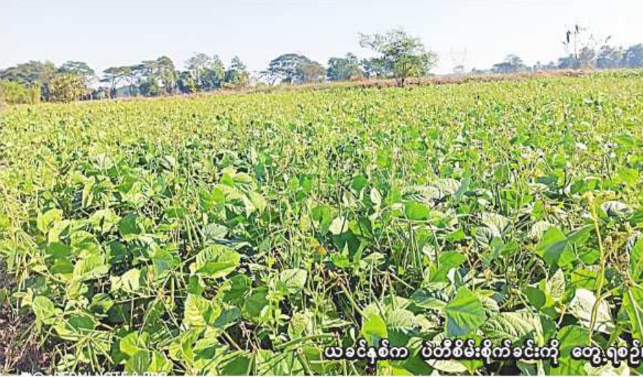
ယခုနှစ်က ပဲတီစိမ်းစိုက်ခင်းကို တွေ့ရစဉ်။