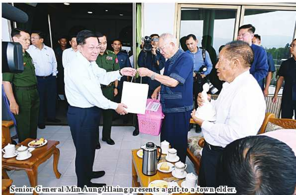
Senior General Min Aung Hlaing presents a gift to a town elder.