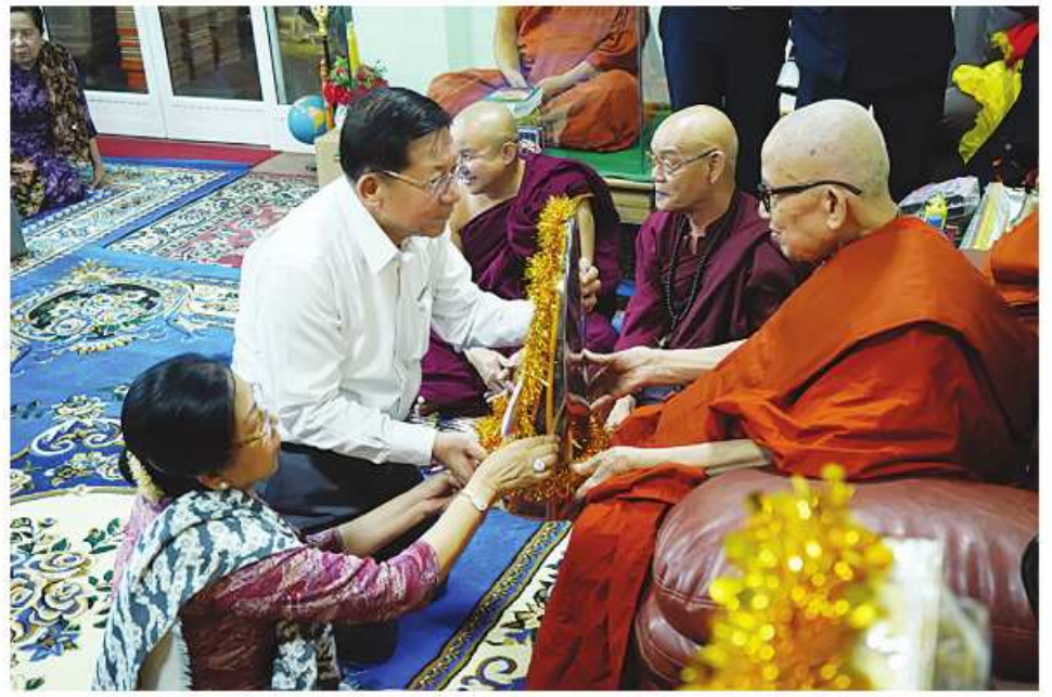
သက်တော် ၉၉ နှစ်ရှိ သက်တော်ရှည် ကျိုင်းယင်းကျောင်းတိုက် ဦးစီးပဓာနနာယကဆရာတော် အဂ္ဂမဟာ သဒ္ဓမ္မဇောတိကဓဇ ဘဒ္ဒန္တဓမ္မာစာရအား နိုင်ငံတော်စီမံအုပ်ချုပ်ရေးကောင်စီဥက္ကဋ္ဌ နိုင်ငံတော်ဝန်ကြီးချုပ် ဝိလ်ချပ်မျိုးကြီးမင်းအောင်လှိုင်နှင့်အနီး ခေါ်ကြားကြားလှတို့ ဖူးမြော်ကြည်ညိုစဉ်။