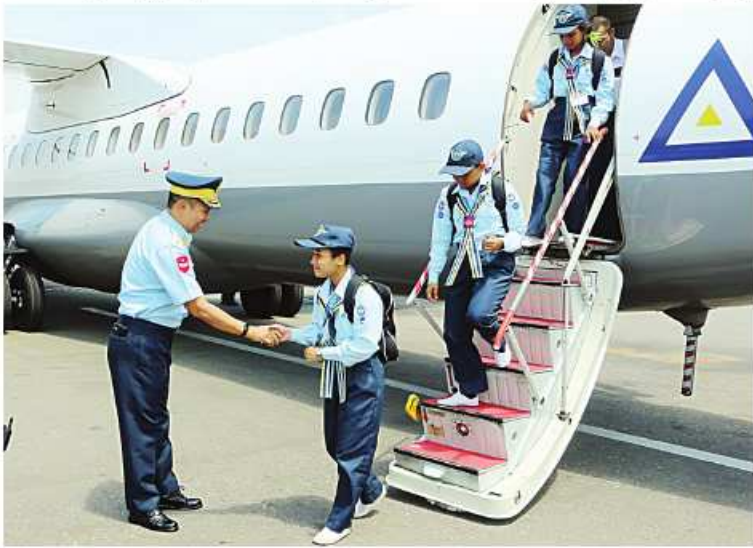
အခြေခံလေကြောင်းလူငယ်သင်တန်းနှင့် တန်းမြင့်လေကြောင်းလူငယ်သင်တန်းများ မှ သင်တန်းသား၊ သင်တန်းသူများ တပ်မတော်လေယာဉ်ပြိုင် မိတ္ထီလာမြို့သို့ရောက်ရှိစဉ်။

တပ်မတော်(ရေ)က ၂၀၂၄ ခုနှစ် ရေကြောင်းလူငယ်အခြေခံနှင့် တန်းမြင့် သင်တန်းများကိုလေ့ကျင့်သင်ကြားလျက်ရှိ ရာ ယနေ့နံနက်ပိုင်းတွင် ရေကြောင်းလူငယ် အခြေခံနှင့် တန်းမြင့်သင်တန်းအမှတ်စဉ် (၁/၂၀၂၄) စခန်းပေါင်းစုံမှ သင်တန်းသား၊ သင်တန်းသူများသည် ရန်ကုန်မြို့ရှိ ရေတပ်စခန်းဌာနချုပ်၌ စခန်း ပေါင်းစုံတွေ့ဆုံပွဲပြုလုပ်ကြသည်။