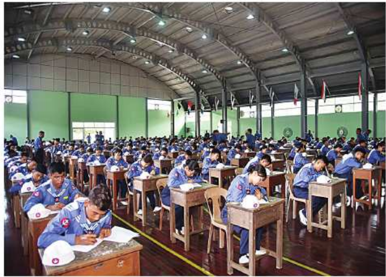
ရေကြောင်းလူငယ်သင်တန်းသား၊သင်တန်းသူများ ရေတပ်သားဘာသာရပ်ဆိုင်ရာ ရေးဖြေစာမေးပွဲပြေဆိုစဉ်။

တာဝန် ပွဲစည်းဆောင်ရွက်မှုလက်တွေ့ ဖြိုင်ပွဲများကိုပါဝင်ယှဉ်ပြိုင်ခဲ့ကြသည်။ အလားတူ တပ်မတော်(လေ)က ၂၀၂၄ အခြေခံလေကြောင်းလူငယ် သင်တန်းနှင့် တန်းမြင့်လေကြောင်းလူငယ်သင်တန်းများ ကိုပွင့်လှစ်သင်ကြားလျက်ရှိရာ ယနေ့တွင် နယ်မြေဒေသအသီးသီးရှိ သင်တန်းစခန်း ၁၇ ခုမှ သင်တန်းသား၊ သင်တန်းသူများ သည် ပြိုင်ပွဲများကျင်းပရန်နှင့် ဒေသန္တရ လေ့လာရေးခရီးစဉ်များ သွားရောက်ရန် တပ်မတော်လေယာဉ်များ၊ တပ်မတော် မော်တော်ယာဉ်များဖြင့် မိတ္ထီလာမြို့သို့