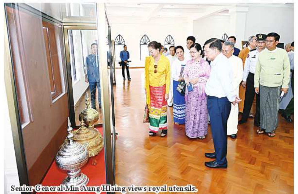
Senior General Min Aung Hlaing views royal utensils.