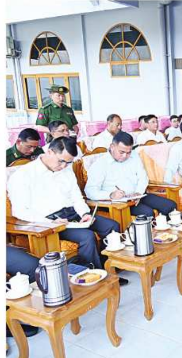
နိုင်ငံတော်စီမံအုပ်ချုပ်ရေးကောင်စီဥက္ကဋ္ဌ နိုင်ငံတော်ဝန်ကြီးချုပ် ဗိုလ်ချုပ်မှူးကြီးမင်းအောင်လှိုင်အား ကျိုင်းတုံမြို့ရှိ မြို့မိမြို့ဖများက ဒေသဖွံ့ဖြိုးတိုးတက်ရေးဆိုင်ရာများနှင့်ပတ်သက်၍ တင်ပြစဉ်။

(အရှေ့ပိုင်း)ဒေသသည် ယခင်က မူးယစ် ဆေးဝါးနှင့်ပတ်သက်၍ နာမည်ထွက်ပေါ်ခဲ့ ကြောင်း၊ မိမိတို့ဒေသအတွင်း မူးယစ် ဆေးဝါးအပါအဝင် တရားမဝင်လုပ်ငန်းများ ဆောင်ရွက်မှုမရှိစေရေး ထိန်းသိမ်းဆောင်