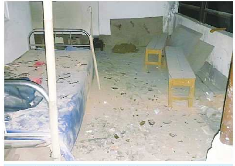
ဘူးသီးတောင်မြို့ ပြည်သူ့ဆေးရုံဝင်းအတွင်းသို့ AA အကြမ်းဖက်သောင်းကျန်းသူများပစ်ခတ်သည့် လက်နက်ကြီးကျည်ကျရောက်ပေါက်ကွဲမှုကြောင့် ပျက်စီးခဲ့သည့် အဆောက်အအုံမှတ်တမ်းဓာတ်ပုံ။

ညအချိန်အိပ်နေချိန်တွင် လျှပ်စစ်မီးများပိတ်ထားခြင်းဖြင့် လျှပ်စစ်ကိုနေ့စဉ်ချွေတာသင့်ပါသည်