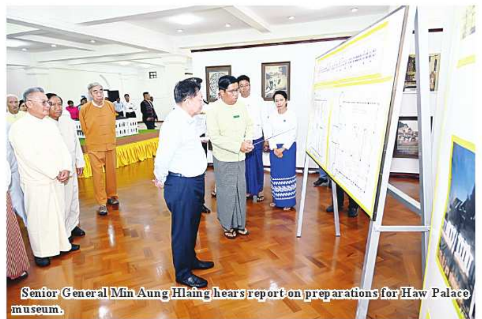
Senior General Min Aung Hlaing hears report on preparations for Haw Palace museum.