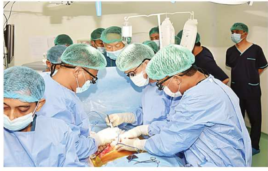
တပ်မတော်မှ အသည်းအစားထိုးခွဲစိတ်ကုသမှုအဖွဲ့နှင့် အိန္ဒိယနိုင်ငံမှ အသည်းအစားထိုးခွဲစိတ်ကုသမှုအဖွဲ့တို့ ပူးပေါင်း၍ အသည်းအစားထိုးခွဲစိတ်ကုသမှုကို ဆောင်ရွက်နေစဉ်။

ကို ညနေ ၅ နာရီခန့်တွင် အသည်းလက်ခံလူနာထံသို့ အစားထိုးခွဲစိတ်ကုသခြင်းဆောင်ရွက်ခဲ့ကာ စုစုပေါင်းခွဲစိတ်ချိန် ၁၀ နာရီခွဲကြာမြင့်ခဲ့သည်။ အသည်းအလျှင်လူနာနှင့် အသည်းလက်ခံလူနာများ၏ ခွဲစိတ်ပြီးနောက်ပိုင်း ကျန်းမာရေးအခြေအနေမှာကောင်းမွန်လျက်ရှိပြီး အထူးကြပ်မတ်ကုသခန်း၌ လိုအပ်သောပြုစုကုသမှုများကို သက်ဆိုင်ရာပါရဂူများ၊ ဆေးမှူးများနှင့် သူနာပြု ကျွမ်းကျင်သူများက ဆက်လက်ဆောင်ရွက်ပေးလျက်ရှိသည်။ အသည်းအစားထိုး ခွဲစိတ်ကုသမှုကို တာဝန်ရှိသူများက ကြည့်ရှုအားပေးခဲ့ကြောင်း သတင်းရရှိသည်။