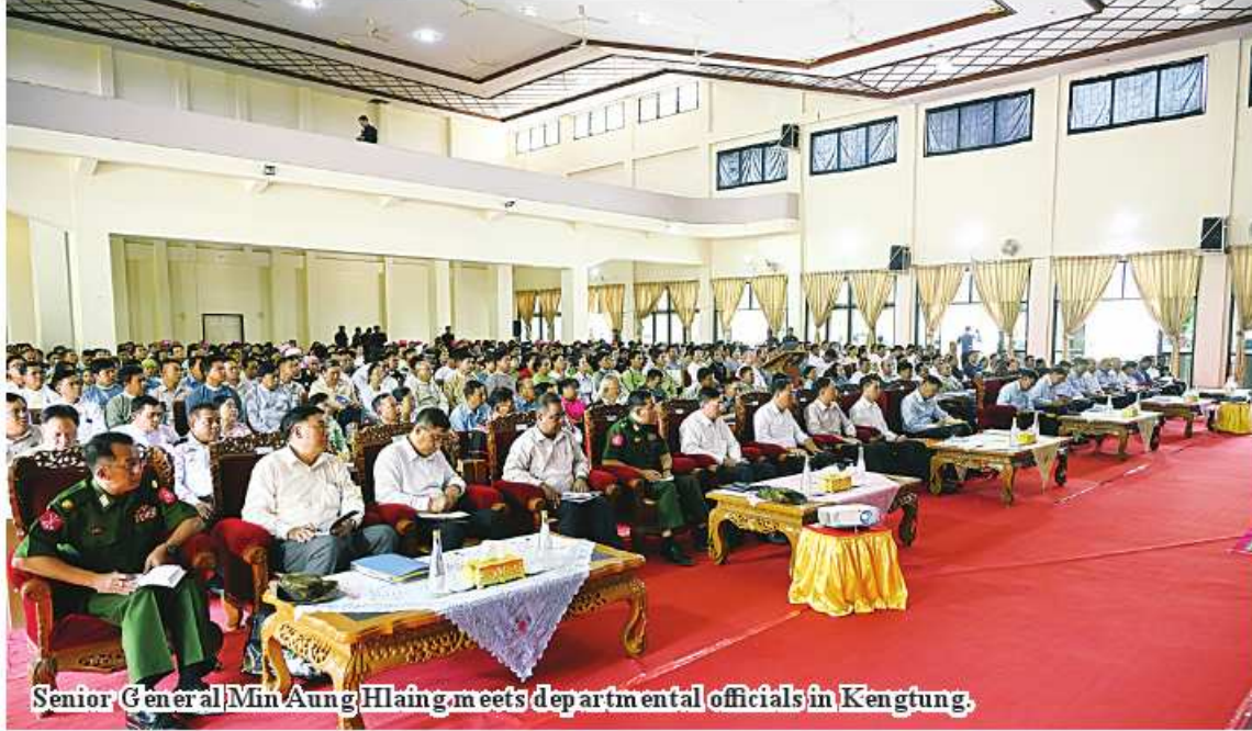
Senior General Min Aung Hlaing meets departmental officials in Kengtung.