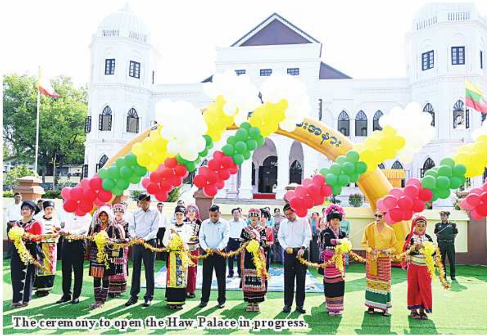
The ceremony to open the Haw Palace in progress.

Nay Pyi Taw May 12 A ceremony to inaugurate the already-built museum which is a replica of Haw Palace of Kengtung Saopha Sao Kawng Kiao Intaleng took place at the land of Haw Palace in Haw Palace Park on Nawngtong lake circular road in Ward 5 of Kengtung, Shan State (East) this morning, with attendance of Chairman of the State Administration Council Prime Minister Senior General Min Aung Hlaing.