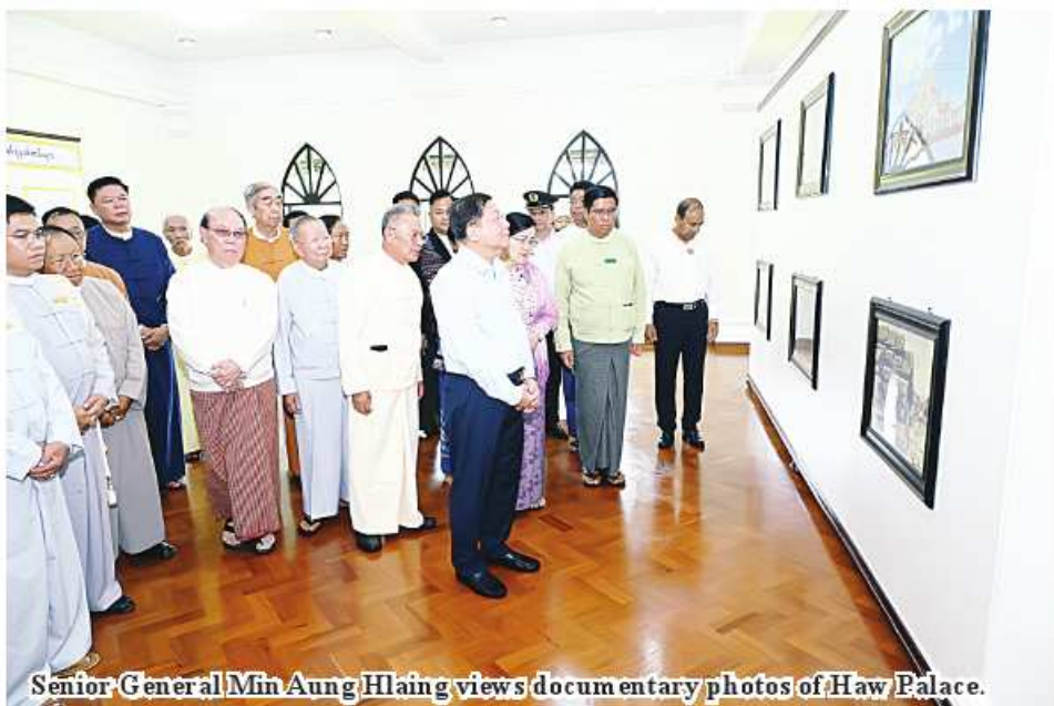
Senior General Min Aung Hlaing views documentary photos of Haw Palace.

Engineering Maj-Gen Zaw Naing Oo reported on the airport's background history and facts, and the upgrading of the runway and airport building. See Page 14