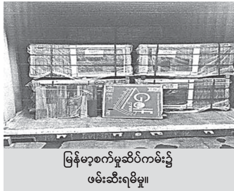
မြန်မာ့စက်မှုဆိပ်ကမ်း၌ ဖမ်းဆီးရမိမှု။