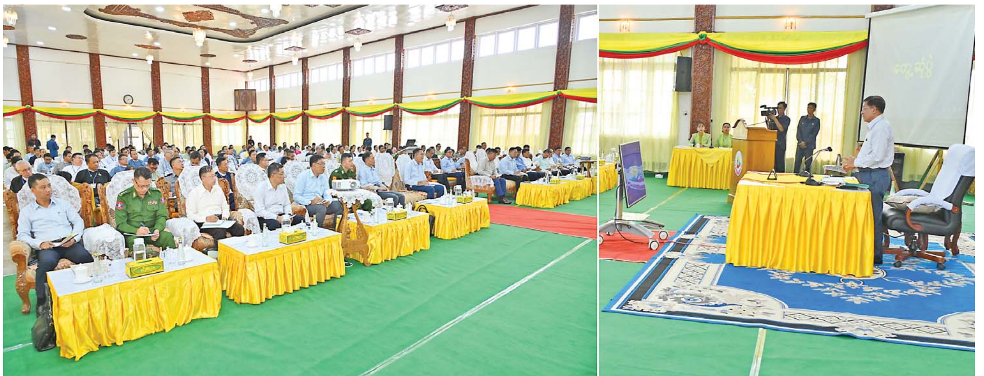
Senior General Min Aung Hlaing meets Shan State Government members and state and district level departmental personnel.