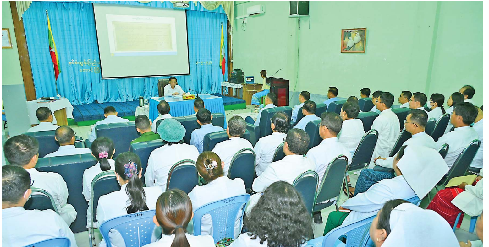
Senior General Min Aung Hlaing speaks in meeting with Sao San Tun Hospital staff.

General pledged to provide necessary machinery for the hospital. It is necessary to systematically conduct treatment with the use of machinery. Necessary hospitals will be upgraded and extended among other hospitals in Shan State, depending on population of the hospital