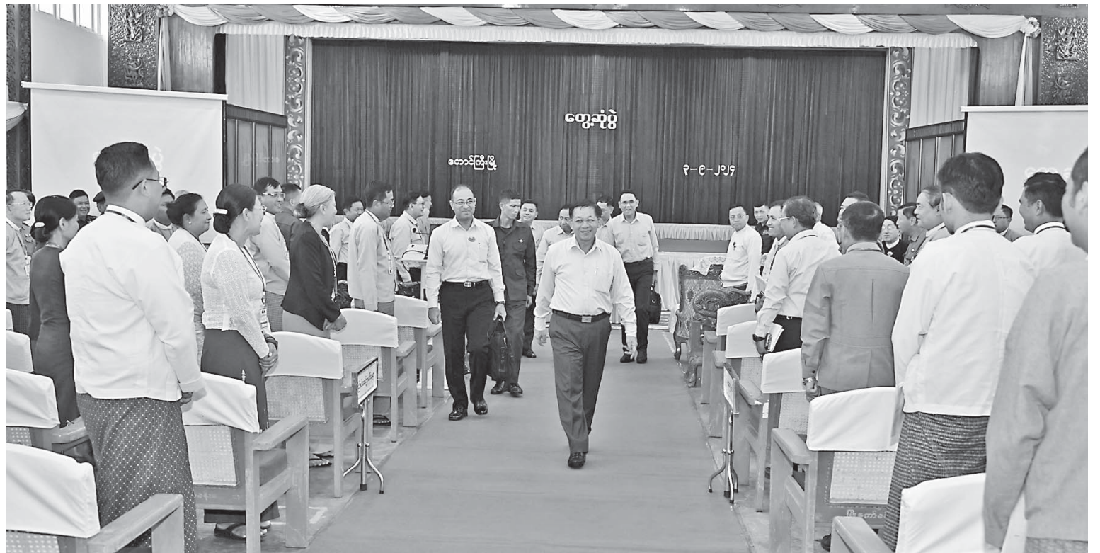
Senior General Min Aung Hlaing greets Shan State Government members and state and district level departmental personnel.

The Senior General continued by highlighting the interconnectedness of the economy and politics, noting that a strong economy often leads to a stable political environment. He pointed out that domestic manufacturing in the country has historically been weak, with a higher reliance on foreign imports compared to exports. This heavy import reliance has increased the demand for foreign currency. Previously, revenue from abroad primarily came from loans, grants, and foreign in-