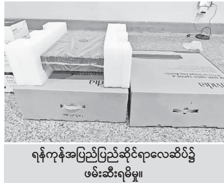
ရန်ကုန်အပြည်ပြည်ဆိုင်ရာလေဆိပ်၌ ဖမ်းဆီးရမိမှု။