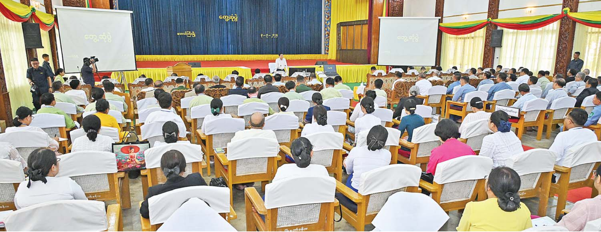
နိုင်ငံတော်စီမံအုပ်ချုပ်ရေးကောင်စီဥက္ကဋ္ဌ နိုင်ငံတော်ဝန်ကြီးချုပ် ဗိုလ်ချုပ်မှူးကြီးမင်းအောင်လှိုင် ရှမ်းပြည်နယ်အစိုးရအဖွဲ့ဝင်များ၊ ပြည်နယ်နှင့်ခရိုင်အဆင့်ဌာနဆိုင်ရာတာဝန်ရှိသူများအား တွေ့ဆုံအမှာစကားပြောကြားစဉ်။

ပါတီစုံဒီမိုကရေစီစနစ်ကိုအခြေခံသည့် ပြည်ထောင်စုကိုတည်ဆောက်ရာတွင် စည်းကမ်းစနစ်ကျနသည့် လူ့အဖွဲ့အစည်း၊ အသိုက်အဝန်းကိုပုံဖော်ပေးရန်လိုပြီး ဥပဒေကို လူတိုင်းသိရှိလိုက်နာရမည်ဖြစ်