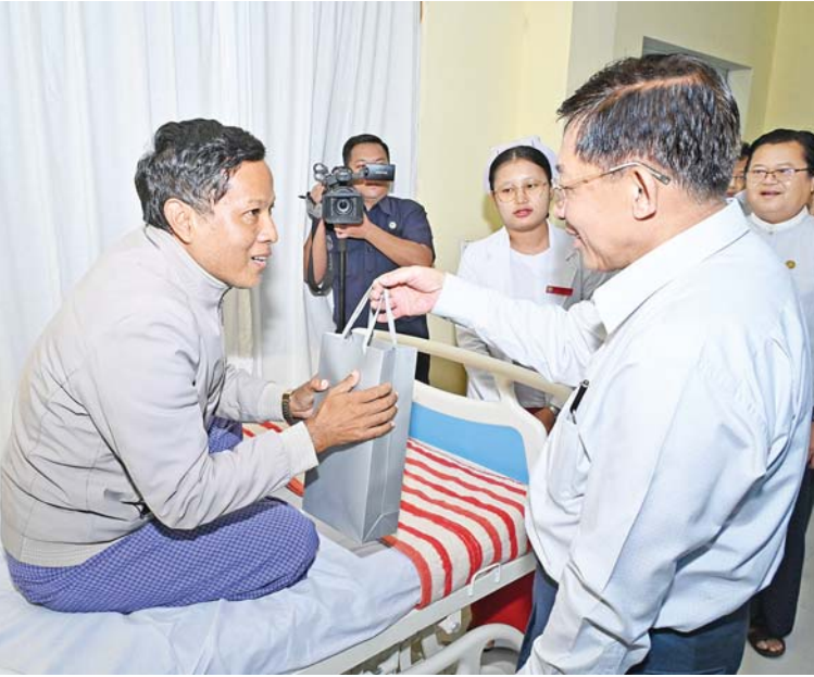
နိုင်ငံတော် စီမံအုပ်ချုပ်ရေး ကောင်စီဥက္ကဋ္ဌ နိုင်ငံတော်ဝန်ကြီးချုပ် ဗိုလ်ချုပ်မှူးကြီး မင်းအောင်လှိုင် ဆေးကုသမှု ခံယူလျက်ရှိသည့် ဒေသခံပြည်သူ တစ်ဦး၏ ကျန်းမာရေး အခြေအနေများကို မေးမြန်းအားပေး စကားပြောကြားပြီး စားသောက်ဖွယ်ရာများ ပေးအပ်စဉ်။