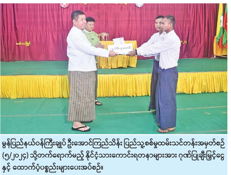
မွန်ပြည်နယ်ဝန်ကြီးချုပ် ဦးအောင်ကြည်သိန်း ပြည်သူ့စစ်မှုထမ်းသင်တန်းအမှတ်စဉ် (၅/၂၀၂၄) သို့တက်ရောက်မည့် နိုင်ငံ့သားကောင်းရတနာများအား ဂုဏ်ပြုချီးမြှင့်ငွေ နှင့် ထောက်ပံ့ပစ္စည်းများပေးအပ်စဉ်။

များအား ပြည်နယ်ဝန်ကြီးချုပ်နှင့် တိုင်းမှူးတို့က ရင်းရင်းနှီးနှီးတွေ့ဆုံ အားပေးစကားပြောကြားပြီး ဂုဏ်ပြုချီးမြှင့် ငွေများနှင့် ထောက်ပံ့ပစ္စည်းများပေးအပ် ကာ လိုအပ်သည်များ ပေါင်းစပ်ညှိနှိုင်း ဆောင်ရွက်ပေးခဲ့ကြောင်း သတင်းရရှိ သည်။ (၁၀၀)