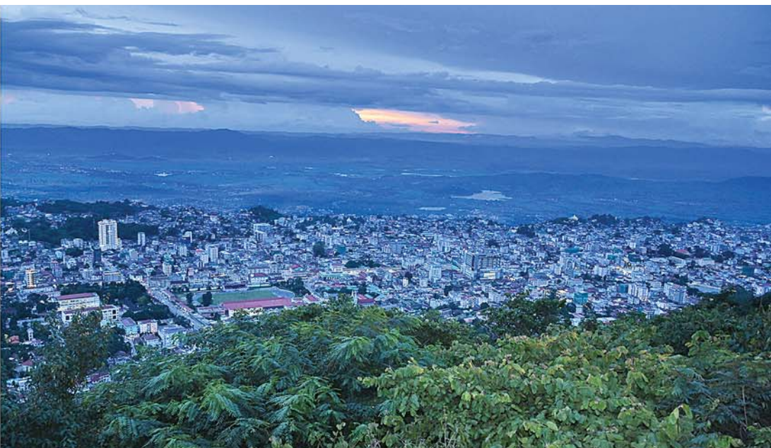
နိုင်ငံတော်စီမံအုပ်ချုပ်ရေးကောင်စီဥက္ကဋ္ဌ နိုင်ငံတော်ဝန်ကြီးချုပ် ဗိုလ်ချုပ်မှူးကြီးမင်းအောင်လှိုင် ရွှေဘုန်းပွင့်စေတီတော်မြတ်ကြီးပေါ်ရှိ ရှုခင်းသာ View Pointမှ တစ်ဆင့် တောင်ကြီးမြို့၏ ရှုခင်းများကို ကြည့်ရှုစဉ်။

* စာမျက်နှာ ၁၇ မှအဆက် အကြမ်းဖက်သမားများ၏ တိုက်ခိုက်မှု များကြောင့် ပိတ်ထားရကြောင်း၊ ကျောင်းနေအရွယ်ကလေးငယ်အားလုံး အနည်းဆုံး KG+9 အဆင့်အထိ တက်ရောက် အောင်မြင်ရန်လိုကြောင်း၊ အခြေခံပညာ အလယ်တန်းအဆင့်အထိ သင်ယူပြီးပါက ဘဝတိုးတက်ရေးအတွက် လိုအပ်သည့် အတတ်ပညာများကို ဆက်လက်သင်ယူ နိုင်မည်ဖြစ်ကြောင်း၊ တက္ကသိုလ်ဝင်တန်း