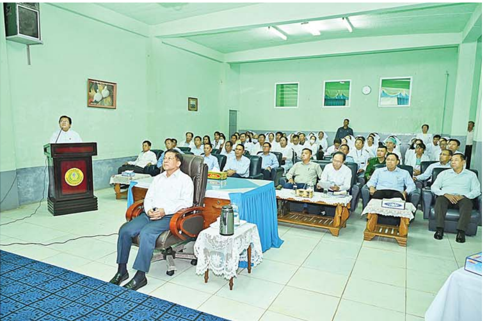
နိုင်ငံတော်စီမံအုပ်ချုပ်ရေးကောင်စီဥက္ကဋ္ဌ နိုင်ငံတော်ဝန်ကြီးချုပ် ဗိုလ်ချုပ်မှူးကြီးမင်းအောင်လှိုင်အား ဆေးရုံအုပ်ကြီး ဒေါက်တာဝင်းမော်ဦးက ဆေးရုံ၏သမိုင်းအကျဉ်း၊ အဆောက်အအုံများဆောက်လုပ်ထားရှိမှုနှင့် လူနာဆောင်သစ်များ ဆောက်လုပ်ထားရှိမှုအခြေအနေများနှင့်ပတ်သက်၍ ရှင်းလင်းတင်ပြစဉ်။