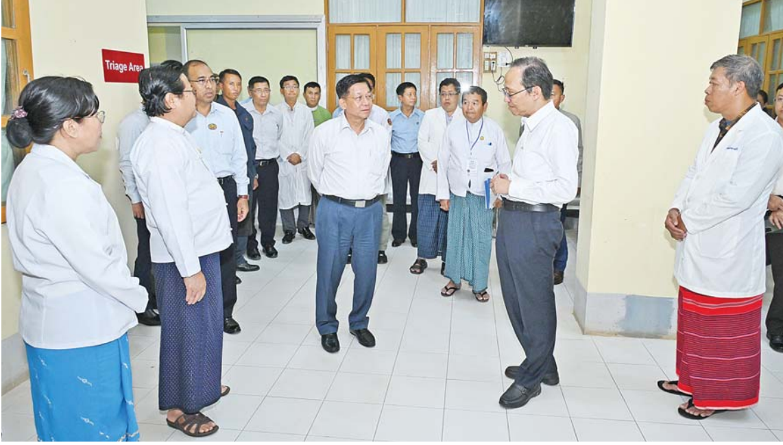
နိုင်ငံတော်စီမံအုပ်ချုပ်ရေးကောင်စီဥက္ကဋ္ဌ နိုင်ငံတော်ဝန်ကြီးချုပ် ဗိုလ်ချုပ်မှူးကြီးမင်းအောင်လှိုင် စစ်ဘက်ဆိုင်ရာအချက်အလက်များ ပြည်သူ့ဆေးရုံကြီးအတွင်း လှည့်လည်ကြည့်ရှုစဉ်။