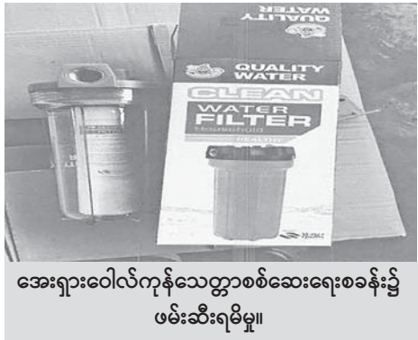
အေးရှားဝေါလ်ကုန်သေတ္တာစစ်ဆေးရေးစခန်း၌ ဖမ်းဆီးရမိမှု။