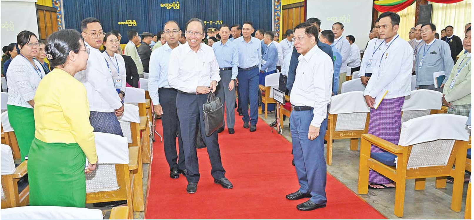
နိုင်ငံတော်စီမံအုပ်ချုပ်ရေးကောင်စီဥက္ကဋ္ဌ နိုင်ငံတော်ဝန်ကြီးချုပ် ဗိုလ်ချုပ်မှူးကြီးမင်းအောင်လှိုင် တက်ရောက်လာကြသည့် ရှမ်းပြည်နယ်အစိုးရအဖွဲ့ဝင်များ၊ ပြည်နယ်နှင့်ခရိုင်အဆင့် ဌာနဆိုင်ရာတာဝန်ရှိသူများအား ရင်းရင်းနှီးနှီးနှုတ်ဆက်စဉ်။

လူထုတို့ကို လူသားတံတိုင်းအဖြစ် အသုံးပြုနိုင်ရေး ယာယီနေရပ်စွန့်ခွာနေရသူများကို ပြန်လည်နေထိုင်ရန် ဆွဲဆောင်စည်းရုံးခြင်း၊ အတင်းအဓမ္မလူသစ်စုဆောင်းခြင်းများကိုလုပ်ဆောင်လျက်ရှိမှု၊ တပ်မတော်အနေဖြင့် နိုင်ငံတော်၏အချုပ်အခြာအာဏာကို မဖြစ်မနေကာကွယ်စောင့်ရှောက်သွားမည်ဖြစ်ပြီး အဆိုပါလက်နက်ကိုင်အကြမ်းဖက်သောင်းကျန်းသူများ၏ သတင်းရရှိမှုနှင့် အခြေအနေအရပ်ရပ်အပေါ် မူတည်၍ လိုအပ်သလို တုံ့ပြန်ဆောင်ရွက်သွားမည်ဖြစ်သဖြင့် ၎င်းတို့အမေ့ဝင်ရောက်နေထိုင်လျက်ရှိသည့် မြို့၊ ရွာများရှိ ပြည်သူများအနေဖြင့် ၎င်းတို့၏အသုံးချမှုမခံရစေရေးနှင့် ဘေးကင်းလုံခြုံမှုရှိစေရေးတို့အတွက် သတိပြုကြရန်လိုအပ်မှု နိုင်ငံတော်နှင့် တပ်မတော်အနေဖြင့် နိုင်ငံတစ်ဝန်းတည်ငြိမ်အေးချမ်းမှုများ အမြန်ဆုံး ပြန်လည်ရရှိရေးအတွက် စည်းလုံးသော အင်အားဖြင့် ကြိုးပမ်းဆောင်ရွက်လျက်ရှိမှု အခြေအနေများကို အကျယ်တဝင့်ရှင်းလင်း