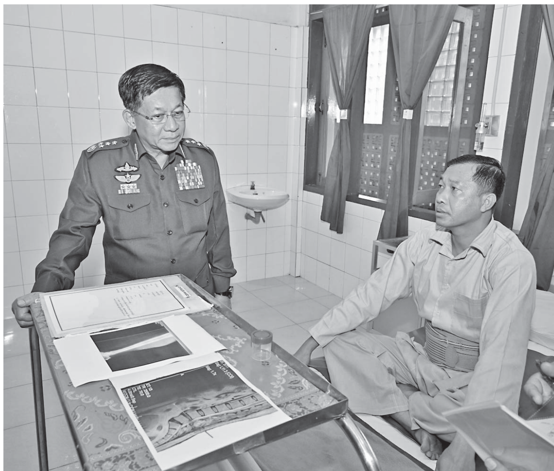
Senior General Min Aung Hlaing inquires about the health of a patient.

Afterwards, the Senior General inspected the construction progress of a 400-meter running track and football field within the hospital premises and provided necessary guidance based on the reports from the responsible personnel.