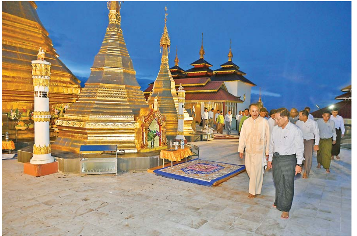
Senior General Min Aung Hlaing visits the Shwe Phone Pwint Pagoda.

As regards the reports, SAC member Union Minister for Home Affairs Lt-Gen Yar Pyae explained the implementation of public security system based on the people, supervision of administrators at all levels to ensure that the implementation of people's militia law do not cause burden for the public and is in accord with the law, public participation in law enforcement undertakings of the relevant areas to wipe out online gambling, online fraud and illicit drug trafficking, necessary preparations for success of population and housing census, Union Minister for Border Affairs Lt-Gen Tun Tun Naung explained financial years-wise border areas development undertakings, development undertakings including construction of roads, bridges, buildings, water