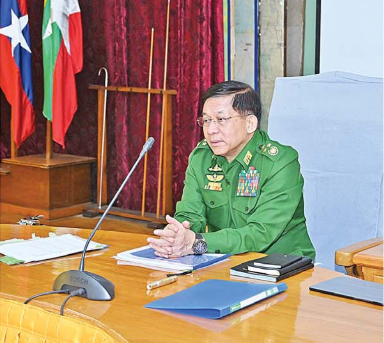
နိုင်ငံတော်စီမံအုပ်ချုပ်ရေးကောင်စီဥက္ကဋ္ဌ တပ်မတော်ကာကွယ်ရေးဦးစီးချုပ် ဗိုလ်ချုပ်မှူးကြီးမင်းအောင်လှိုင် အရှေ့ပိုင်းတိုင်းစစ်ဌာနချုပ်နယ်မြေအတွင်း နယ်မြေတည်ငြိမ်အေးချမ်းရေးဆိုင်ရာဆောင်ရွက်ထားရှိမှုများနှင့်ပတ်သက်၍ ရှင်းလင်းတင်ပြမှုများအပေါ် လမ်းညွှန်မှာကြားစဉ်။

နေပြည်တော် စက်တင်ဘာ ၃ နိုင်ငံတော်စီမံအုပ်ချုပ်ရေးကောင်စီဥက္ကဋ္ဌ တပ်မတော်ကာကွယ်ရေးဦးစီးချုပ် ဗိုလ်ချုပ်မှူးကြီးမင်းအောင်လှိုင်သည် ကာကွယ်ရေးဦးစီးချုပ် (ရေ) ဒုတိယဗိုလ်ချုပ်ကြီးထိန်ဝင်း၊ ကာကွယ်ရေးဦးစီးချုပ်(လေ) ဗိုလ်ချုပ်ကြီးထွန်းအောင်၊ ပြည်ထောင်စုအဆင့်ပုဂ္ဂိုလ်များ၊ ကာကွယ်ရေးဦးစီးချုပ်ရုံးမှ အဆင့်မြင့်တပ်မတော်အရာရှိကြီးများနှင့် တာဝန်ရှိသူများ လိုက်ပါ၍ ယနေ့နံနက်ပိုင်းတွင် အရှေ့ပိုင်းတိုင်းစစ်ဌာနချုပ် နယ်မြေအတွင်း နယ်မြေတည်ငြိမ်အေးချမ်းရေးဆိုင်ရာဆောင်ရွက်ထားရှိမှုများကို စစ်ဆေးသည်။ စာမျက်နှာ ၁၁ ကော်လံ ၃ ●