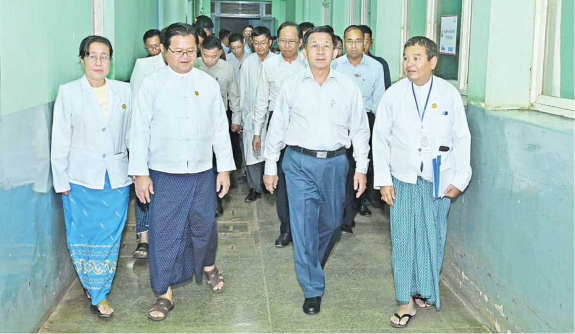
နိုင်ငံတော်စီမံအုပ်ချုပ်ရေးကောင်စီဥက္ကဋ္ဌ နိုင်ငံတော်ဝန်ကြီးချုပ် ဗိုလ်ချုပ်မှူးကြီးမင်းအောင်လှိုင် စစ်ဘက်ဆိုင်ရာအချက်အလက်များ ပြည်သူ့ဆေးရုံကြီးအတွင်း လှည့်လည်ကြည့်ရှုစဉ်။

ထို့နောက် နိုင်ငံတော်စီမံအုပ်ချုပ်ရေးကောင်စီဥက္ကဋ္ဌ နိုင်ငံတော်ဝန်ကြီးချုပ်က အမှာစကားပြောကြားရာတွင်ပြည်သူတိုင်း ကျန်းမာရန်လိုကြောင်း၊ ကျန်းမာမှုပညာသင်ကြားနိုင်မည်၊ ကျန်းမာမှုအလုပ်လုပ်နိုင်မည်ဖြစ်ကြောင်း၊ ကျန်းမာရေးနှင့်ပတ်သက်၍ ငယ်ရွယ်စဉ်ကတည်းကပင် အခြေခံကောင်းများရှိရန်လိုကြောင်း၊ ထို့ကြောင့်အစားအသောက်မှအစ ကုတင်စိုက်ဆောင်ရွက်ရန်လိုကြောင်း၊ ကျန်းမာရေးနှင့်ပတ်သက်၍ စနစ်တကျဖြင့် ဆောင်ရွက်ပေးကြစေလိုကြောင်း၊ ဆေးရုံများသည် ပြည်သူများအတွက် အားကိုးဖွယ်ရာဖြစ်အောင်ဆောင်ရွက်ကြရန်လိုကြောင်း၊ ပြောဆိုဆက်ဆံမှုမှအစ ကုသစောင့်ရှောက်မှုအပိုင်းတွင်ပါ စနစ်တကျရှိစေလိုကြောင်း၊