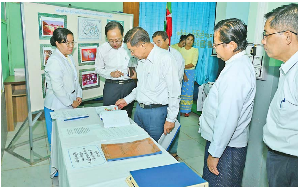
Senior General Min Aung Hlaing views hospital documents.