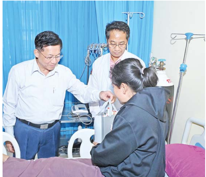
နိုင်ငံတော် စီမံအုပ်ချုပ်ရေး ကောင်စီဥက္ကဋ္ဌ နိုင်ငံတော်ဝန်ကြီးချုပ် ဗိုလ်ချုပ်မှူးကြီး မင်းအောင်လှိုင် ဆေးကုသမှု ခံယူလျက်ရှိသည့် ဒေသခံပြည်သူ တစ်ဦး၏ ကျန်းမာရေး အခြေအနေများကို မေးမြန်းအားပေး စကားပြောကြားပြီး စားသောက်ဖွယ်ရာများ ပေးအပ်စဉ်။