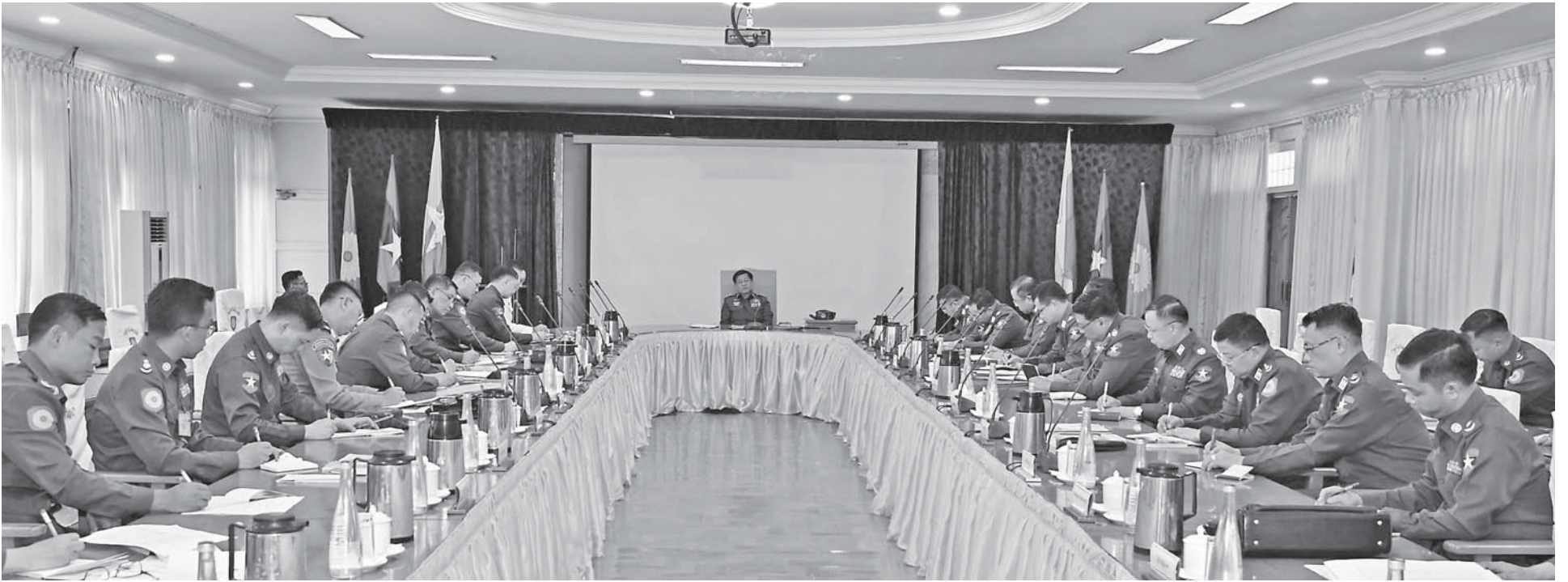
Senior General Min Aung Hlaing gives guidance on measures for regional peace and stability.