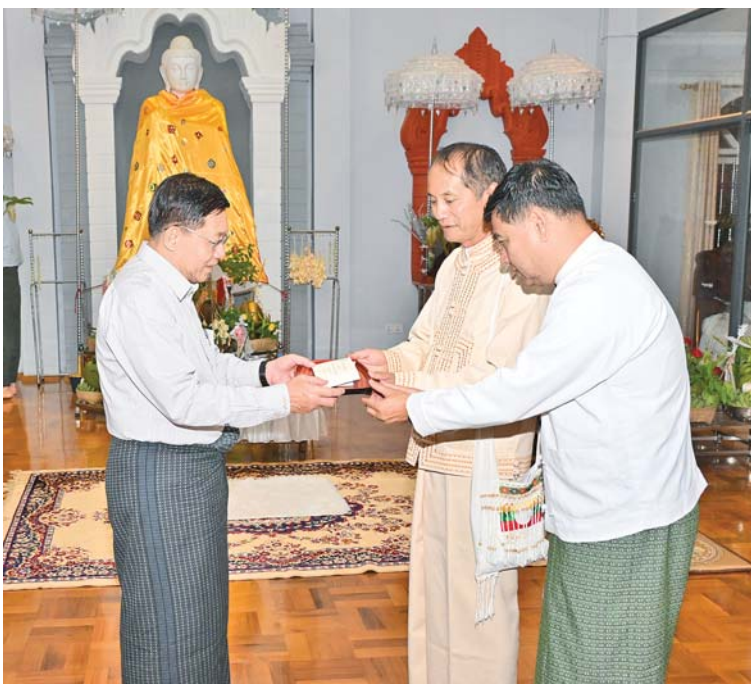
နိုင်ငံတော်စီမံအုပ်ချုပ်ရေးကောင်စီဥက္ကဋ္ဌ နိုင်ငံတော်ဝန်ကြီးချုပ် ဗိုလ်ချုပ်မှူးကြီးမင်းအောင်လှိုင် ရွှေဘုန်းပွင့်စေတီတော်မြတ်ကြီးအတွက် ဘက်စုံအလှူငွေများကို ပေးအပ်လှူဒါန်းစဉ်။

အတွက်လည်း နိုင်ငံတော်အနေဖြင့် စာကြည့်တိုက်များကို တိုးချဲ့ဖွင့်လှစ်၍ စာဖတ်ရန်နှင့် တင်ရေးလုပ်ငန်းများကို ဆောင်ရွက်ပေးနေခြင်းဖြစ်ကြောင်း၊ ပညာ မြင့်မားရေးသည် နိုင်ငံတိုးတက်ရေးပင်ဖြစ် သဖြင့် အလေးထားဆောင်ရွက်ရမည်ဖြစ် ကြောင်း။