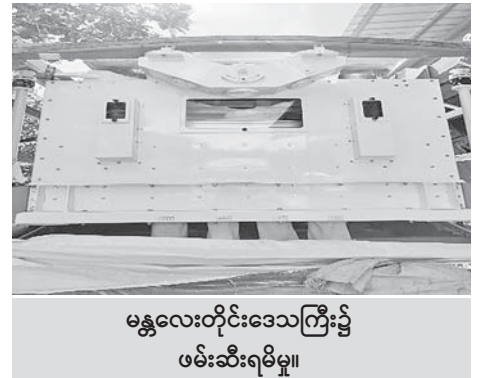
မန္တလေးတိုင်းဒေသကြီး၌ ဖမ်းဆီးရမိမှု။