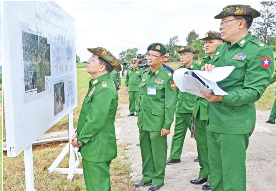
နိုင်ငံတော်စီမံအုပ်ချုပ်ရေးကောင်စီဥက္ကဋ္ဌ တပ်မတော်ကာကွယ်ရေးဦးစီးချုပ် ဗိုလ်ချုပ်မှူးကြီးမင်းအောင်လှိုင် အောင်ပန်းမြို့ရှိ နယ်မြေခံတပ်မတော်ဆေးရုံအတွင်း မိတာ(၄၀၀) ပြေးလမ်းပါ ဘောလုံးကွင်းတည်ဆောက်ရန် ဆောင်ရွက်နေမှုအခြေအနေများကို ကြည့်ရှုစစ်ဆေးစဉ်။