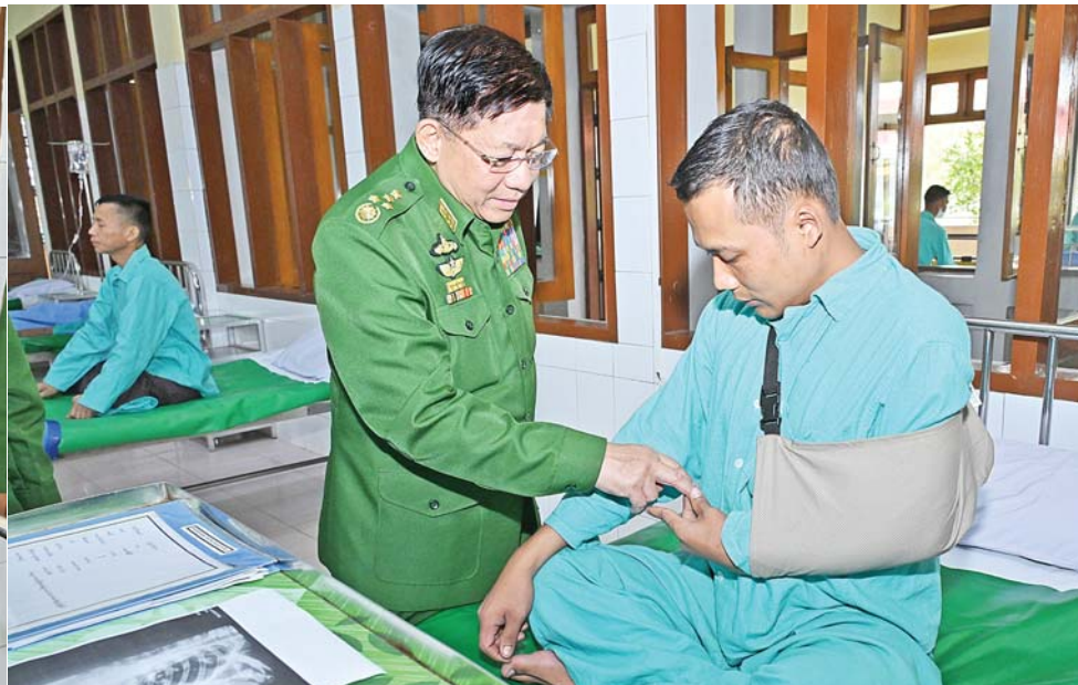
နိုင်ငံတော်စီမံအုပ်ချုပ်ရေးကောင်စီဥက္ကဋ္ဌ တပ်မတော်ကာကွယ်ရေးဦးစီးချုပ် ဗိုလ်ချုပ်မှူးကြီး မင်းအောင်လှိုင် ဆေးကုသမှုခံယူလျက်ရှိသည့် နိုင်ငံတော်ကာကွယ်ရေးနှင့် လုံခြုံရေးတာဝန်များထမ်းဆောင် စဉ် ထိခိုက်ဒဏ်ရာရရှိခဲ့သော အရာရှိ၊ စစ်သည်များအား တစ်ဦးချင်းလိုက်လံတွေ့ဆုံ၍ ရင်းနှီးနှေးထွေးစွာ မေးမြန်းအေးပေးစကားပြောကြားစဉ်။