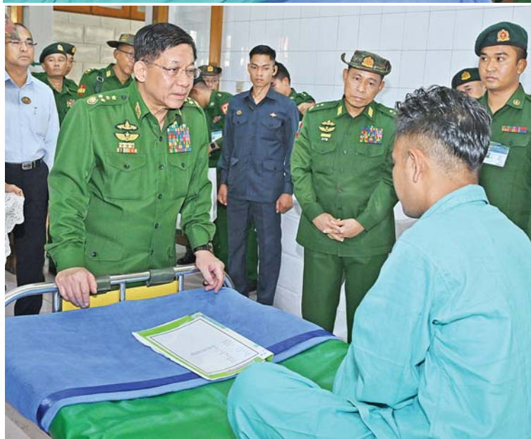
နိုင်ငံတော်စီမံအုပ်ချုပ်ရေးကောင်စီဥက္ကဋ္ဌ တပ်မတော်ကာကွယ်ရေးဦးစီးချုပ် ဗိုလ်ချုပ်မှူးကြီးမင်းအောင်လှိုင် ဆေးကုသမှုခံယူလျက်ရှိသည့် နိုင်ငံတော် ကာကွယ်ရေးနှင့် လုံခြုံရေးတာဝန်များထမ်းဆောင်စဉ် ထိခိုက်ဒဏ်ရာရရှိ ခဲ့သော အရာရှိ၊ စစ်သည်များအား တစ်ဦးချင်းလိုက်လံတွေ့ဆုံ၍ ရင်းနှီးနှေးထွေးစွာ မေးမြန်းအေးပေးစကားပြောကြားစဉ်။