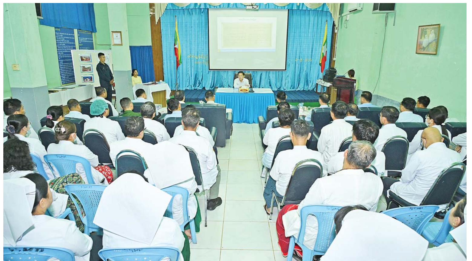
နိုင်ငံတော်စီမံအုပ်ချုပ်ရေးကောင်စီဥက္ကဋ္ဌ နိုင်ငံတော်ဝန်ကြီးချုပ် ဗိုလ်ချုပ်မှူးကြီးမင်းအောင်လှိုင် တောင်ကြီးမြို့၊ စစ်စံထွန်းပြည်သူ့ဆေးရုံကြီး၌ ကျန်းမာရေးဝန်ထမ်း များအား တွေ့ဆုံအမှာစကားပြောကြားစဉ်။

နိုင်ငံတော်စီမံအုပ်ချုပ်ရေးကောင်စီဥက္ကဋ္ဌ နိုင်ငံတော်ဝန်ကြီးချုပ် ဗိုလ်ချုပ်မှူးကြီး မင်းအောင်လှိုင်သည် ခရီးစဉ်တွင်လိုက်ပါ လာသည့် အဖွဲ့ဝင်များနှင့်အတူ ယနေ့ ညနေပိုင်းတွင် ရှမ်းပြည်နယ်(တောင်ပိုင်း) တောင်ကြီးမြို့ရှိ စစ်စံထွန်းပြည်သူ့ဆေးရုံ ကြီးသို့ သွားရောက်ကြည့်ရှုစစ်ဆေးပြီး ကျန်းမာရေးဝန်ထမ်းများအား တွေ့ဆုံ အမှာစကားပြောကြားသည်။ ဦးစွာ နိုင်ငံတော်စီမံအုပ်ချုပ်ရေးကောင်စီ ဥက္ကဋ္ဌ နိုင်ငံတော်ဝန်ကြီးချုပ်နှင့်အဖွဲ့ဝင်များ သည် စစ်စံထွန်းပြည်သူ့ဆေးရုံကြီးသို့ ရောက်ရှိကြရာ ဆေးရုံအုပ်ကြီး ဒေါက်တာ ဝင်းမော်ဦးနှင့် ပါမောက္ခများ၊ အထူးကု ဆရာဝန်ကြီးများနှင့်သူနာပြုများက ကြိုဆို နှုတ်ဆက်ကြသည်။ ယင်းနောက် နိုင်ငံတော်စီမံအုပ်ချုပ်ရေး ကောင်စီဥက္ကဋ္ဌ နိုင်ငံတော်ဝန်ကြီးချုပ်သည် အရေးပေါ်ကုသဆောင်တွင် တက်ရောက် ကုသမှုခံယူလျက်ရှိသည့် ဒေသခံပြည်သူ များကိုကြည့်ရှု၍ ကျန်းမာရေးအခြေအနေ များကို မေးမြန်းအားပေးစကားပြောကြား ပြီး