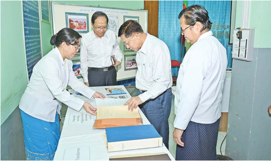
နိုင်ငံတော်စီမံအုပ်ချုပ်ရေးကောင်စီဥက္ကဋ္ဌ နိုင်ငံတော်ဝန်ကြီးချုပ် ဗိုလ်ချုပ်မှူးကြီးမင်းအောင်လှိုင် ခင်းကျင်းပြသထားသည့် စစ်ဘက်ဆိုင်ရာအချက်အလက်များ၊ စက်ပစ္စည်းများနှင့်ပတ်သက်သော မှတ်တမ်းစာအုပ်များအား ကြည့်ရှုစဉ်။