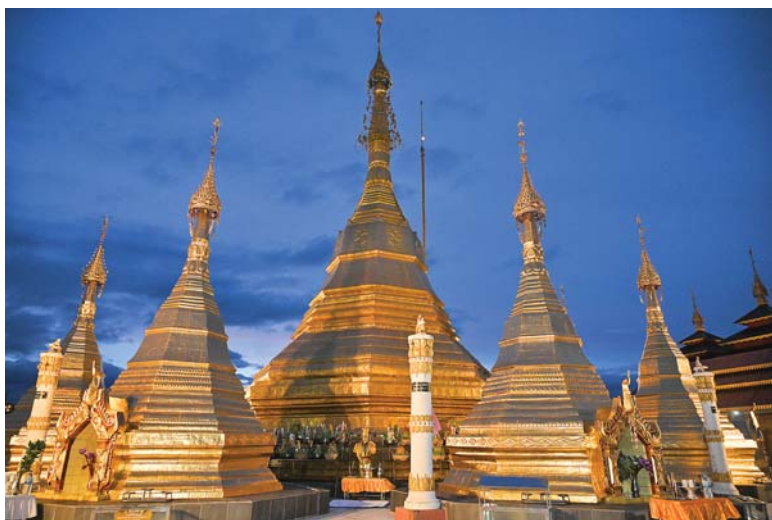
နိုင်ငံတော်စီမံအုပ်ချုပ်ရေးကောင်စီဥက္ကဋ္ဌ နိုင်ငံတော်ဝန်ကြီးချုပ် ဗိုလ်ချုပ်မှူးကြီးမင်းအောင်လှိုင် တောင်ကြီးမြို့ကျက်သရေဆောင် ရွှေဘုန်းပွင့်စေတီတော်မြတ်ကြီးအား ဖူးမြော်ကြည့်ညှိစဉ်။