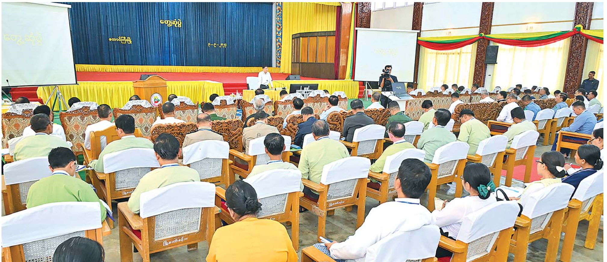
နိုင်ငံတော်စီမံအုပ်ချုပ်ရေးကောင်စီဥက္ကဋ္ဌ နိုင်ငံတော်ဝန်ကြီးချုပ် ဗိုလ်ချုပ်မှူးကြီးမင်းအောင်လှိုင် ရှမ်းပြည်နယ်အစိုးရအဖွဲ့ဝင်များ၊ ပြည်နယ်နှင့်ခရိုင်အဆင့်ဌာနဆိုင်ရာတာဝန်ရှိသူများအား တွေ့ဆုံအမှာစကားပြောကြားစဉ်။

* ကျောပိုးမှအဆက် ကာကွယ်ရေးဦးစီးချုပ်ရုံးမှ အဆင့်မြင့် တပ်မတော်အရာရှိကြီးများ၊ အရှေ့ပိုင်းတိုင်း စစ်ဌာနချုပ် တိုင်းမှူး၊ ဒုတိယဝန်ကြီးများ၊ ရှမ်းပြည်နယ်အစိုးရအဖွဲ့ဝင်များ၊ ပြည်နယ်နှင့် ခရိုင်အဆင့် ဌာနဆိုင်ရာတာဝန်ရှိသူများ တက်ရောက်ကြသည်။