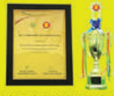
(ASEAN-OSHNET AWARD) တွင် BEST Practices Award ရရှိခဲ့သည့် ရွှေစိနပ်