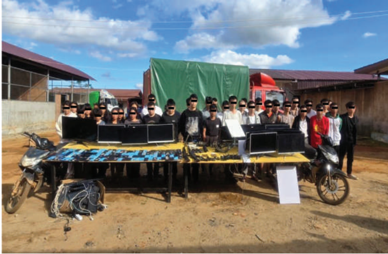
တန့်ယန်းမြို့နယ်၌ တရုတ်နိုင်ငံသား ၁၈ ဦးနှင့် မြန်မာနိုင်ငံသား ၂၇ ဦးတို့ကို Online အသုံးပြု၍ ငွေလိမ်လုပ်ငန်းလုပ်ကိုင်ရာတွင်အသုံးပြုသည့် ဆက်စပ်ပစ္စည်းများ၊ လက်နက်၊ ခဲယမ်းများနှင့်အတူ ဖမ်းဆီးရမိမှုမှတ်တမ်းဓာတ်ပုံ။