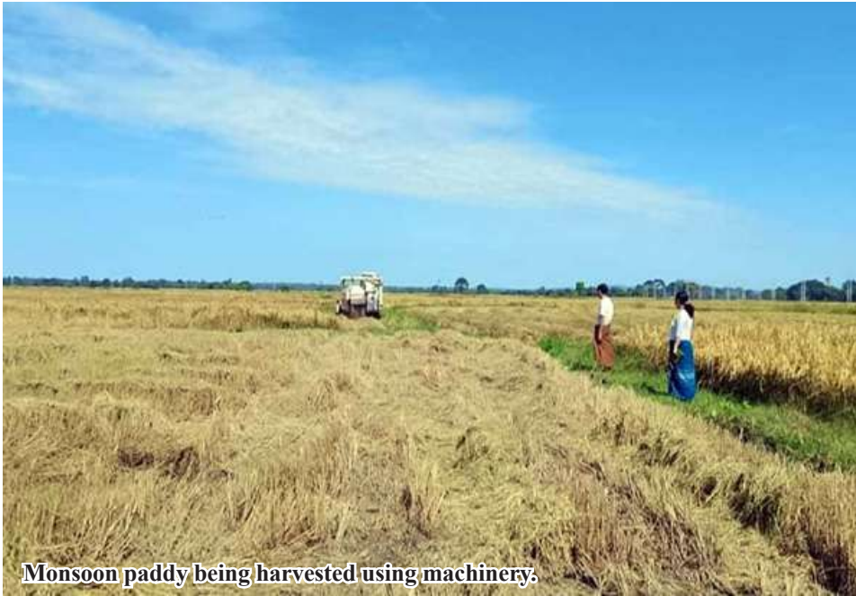
Monsoon paddy being harvested using machinery.

Htigyaing December 5 Statistics of Htigyaing Township Agriculture Department stated that a total of 7,506 acres of monsoon paddy has been harvested in the township of Sagaing Region this year.