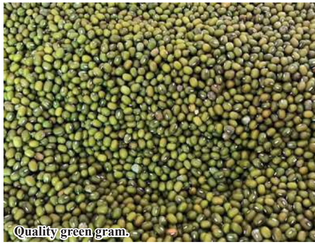
Quality green gram.

niques and prevention of pests and systematic broadcasting of fertilizers to boost per-acre yield of crops. Township authorities provided quality seeds, agricultural inputs and post-harvest technology to local farmers. 206