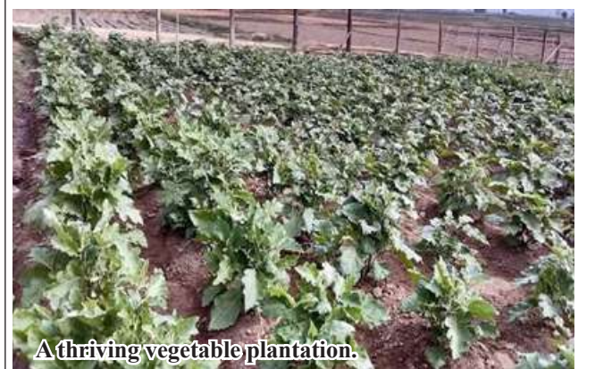
A thriving vegetable plantation.