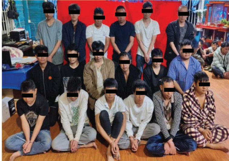
တန့်ယန်းမြို့နယ်၌ Online အသုံးပြု၍ ငွေလိမ်လုပ်ငန်းလုပ်ကိုင်နေသည့် တရုတ်နိုင်ငံသား ချိန်လှပါ အမျိုးသား ၁၈ ဦး၏ မှတ်တမ်းဓာတ်ပုံ။

တစ်လက်၊ ကျည် ခုနစ်တောင့်၊ Type-81 အမျိုးအစားသေနတ် နှစ်လက်၊ ကျည်အိမ် သုံးခု၊ ကျည် အတောင့် ၄၀၊ ၄၀ မမ ပြောင်း တစ်ခု၊ စကားပြောစက် ခြောက်လုံး၊ ဆိုင်ကယ် နှစ်စီး၊ မီးစက် တစ်လုံး၊ WiFi စက် သုံးလုံး၊ DONG FENG ခြောက်ဘီးယာဉ်တစ်စီးတို့နှင့်အတူတွေ့ရှိ ဖမ်းဆီးရမိခဲ့သည်။