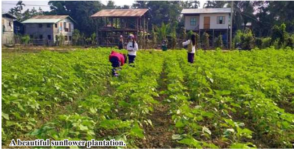
A beautiful sunflower plantation.

Mingin December 5 Statistics of Mingin Township Agriculture Department stated that a total of 1,327 acres of sunflower has been planted as cold season crops in Mingin Township of Sagaing Region. Local farmers started