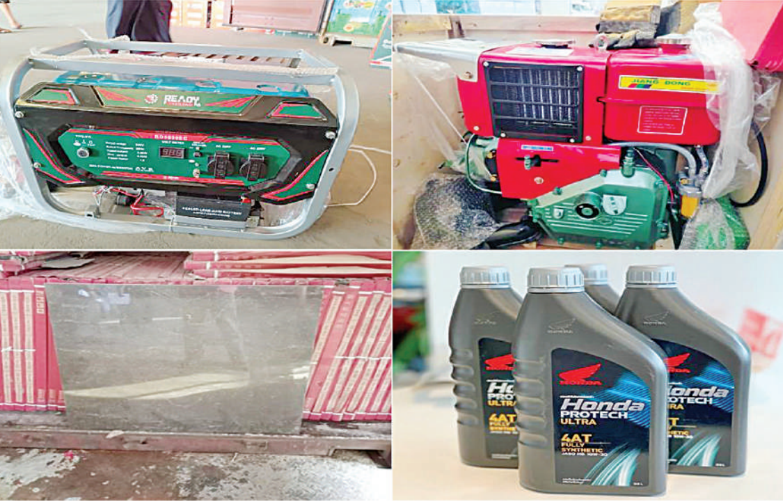
၂၀၂၄ ခုနှစ် နိုဝင်ဘာလအတွင်း ဖမ်းဆီးရမိမှု။

နေပြည်တော် ဒီဇင်ဘာ ၅ တရားမဝင်ကုန်သွယ်မှုတိုက်ဖျက်ရေး ဦးဆောင်ကော်မတီ၏ ကြီးကြပ်ကွပ်ကဲမှုဖြင့် နေပြည်တော်ကောင်စီနယ်မြေအပါအဝင် တိုင်းဒေသကြီး၊ ပြည်နယ်များတွင် တရားမဝင် ကုန်သွယ်မှုတိုက်ဖျက်ရေး အထူးအဖွဲ့များကို ဖွဲ့စည်း၍လည်းကောင်း၊ အကောက်ခွန်ဦးစီးဌာနက ဦးဆောင်သည့် One Stop Service ဌာနဆိုင်ရာအဖွဲ့များ ဖွဲ့စည်း၍လည်းကောင်း၊ နယ်စပ်ဝင်ထွက် ဂိတ်များ၊ နယ်စပ်ကုန်သွယ်ရေးရုံးနှင့် စခန်းများ၊ အမြဲတမ်းစစ်ဆေးရေးစခန်းများ၊ ကုန်သွယ်မှုလမ်းကြောင်းတစ်လျှောက်နှင့် ကုန်ပစ္စည်းသိုလှောင်ရုံများ၊ အပြည်ပြည်ဆိုင်ရာဆိပ်ကမ်းများနှင့် လေဆိပ်များ၊ ကမ်းရိုးတန်းဆိပ်ကမ်းများတွင် တရားမဝင်ကုန်သွယ်မှု တိုက်ဖျက်ရေး လုပ်ငန်းများကို ထိရောက်စွာဆောင်ရွက် လျက်ရှိရာ သတင်းအချက်အလက်ရရှိမှုသည် အလွန်အရေးပါလျက်ရှိသည်။