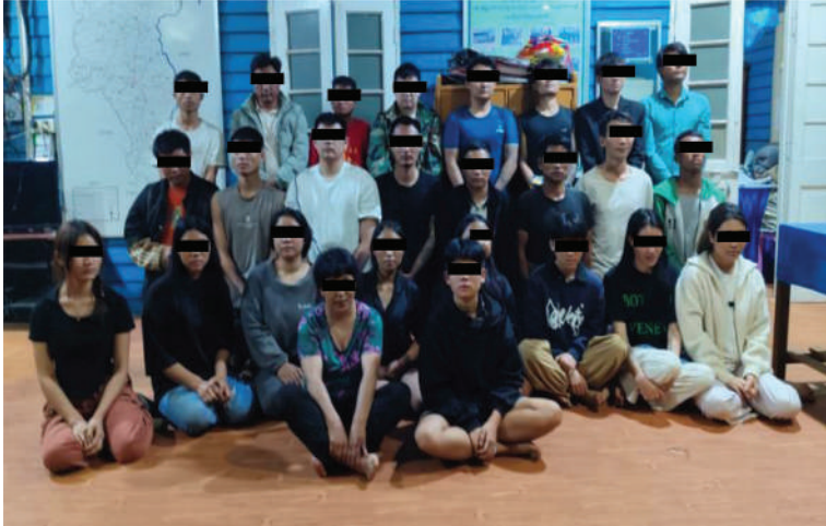
တန့်ယန်းမြို့နယ်၌ Online အသုံးပြု၍ ငွေလိမ်လုပ်ငန်းလုပ်ကိုင်နေသည့် မြန်မာ နိုင်ငံသား အားဖျင်(ခ)စောက်ရီချုံပါ အမျိုးသား ၁၇ ဦးနှင့် အမျိုးသမီး ၁၀ ဦး၏ မှတ်တမ်းဓာတ်ပုံ။

နေပြည်တော် ဒီဇင်ဘာ ၅ လုံခြုံရေးတပ်ဖွဲ့ဝင်များ အနေဖြင့် ဒုစရိုက်မှုများလျော့နည်းပပျောက်ရေးနှင့် အွန်လိုင်းလိမ်လည်မှုလုပ်ငန်းများ တိုက် ဖျက်ရေးတို့အတွက် နယ်မြေအတွင်း သတင်းရယူစုံစမ်းခြင်းနှင့် Online နည်း ပညာများအသုံးပြု၍ ပြစ်မှုကျူးလွန်သူ များကို ခြေရာခံအတည်ပြုကာ တရားခံ များဖော်ထုတ်ဖမ်းဆီးရမိနိုင်ရေး စဉ်ဆက် မပြတ်ကြိုးပမ်းဆောင်ရွက်လျက်ရှိသည်။ ထိုသို့ဆောင်ရွက်လျက်ရှိရာ ဒီဇင် ဘာ ၂ ရက် မွန်းလွဲ ၁ နာရီ ၁၅ မိနစ်တွင် လုံခြုံရေးတပ်ဖွဲ့ဝင်များပါဝင်သောပူးပေါင်း အဖွဲ့သည် ရှမ်းပြည်နယ်(မြောက်ပိုင်း) တန့်ယန်းမြို့နယ် နောင်ဟီးကျေးရွာရှိ နေအိမ်တစ်လုံး၌ တရုတ်နိုင်ငံသားများနှင့် မြန်မာနိုင်ငံသားများပူးပေါင်းကာ Online အသုံးပြု၍ ငွေလိမ်လုပ်ငန်းလုပ်ကိုင် နေကြောင်း သတင်းရရှိသဖြင့် အဆိုပါ နေအိမ်ကိုသက်သေများနှင့်အတူတိုင်ရောက် ရှာဖွေစစ်ဆေးခဲ့သည်။