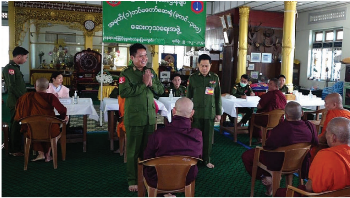
သံဃာတော်များအား မြောက်ပိုင်းတိုင်းစစ်ဌာနချုပ် နယ်လှည့်ဆေးကုသရေးအဖွဲ့က ကျန်းမာရေးစောင့်ရှောက်မှုလုပ်ငန်းများ ဆောင်ရွက်ပေးစဉ်။