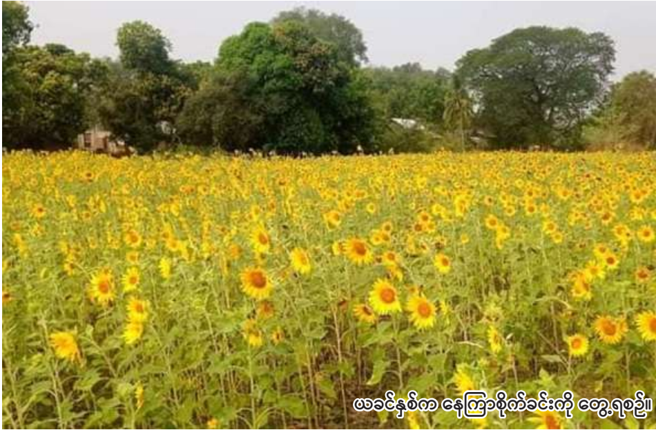
ဖခင်နှစ်က နေကြာစိုက်ခင်းကို တွေ့ရစဉ်။

မြောင်းမြ ဒီဇင်ဘာ ၅ ဧရာဝတီတိုင်းဒေသကြီး မြောင်းမြခရိုင် အိမ်မဲမြို့နယ်တွင် ယခုနှစ်ဆောင်းသီးနှံစိုက်ပျိုးရာသီ ၌ နေကြာကေ ၂၃၁၀ စိုက်ပျိုးသွားမည်ဖြစ်ကြောင်း မြောင်းမြခရိုင် စိုက်ပျိုးရေးဦးစီးဌာနမှ သိရသည်။