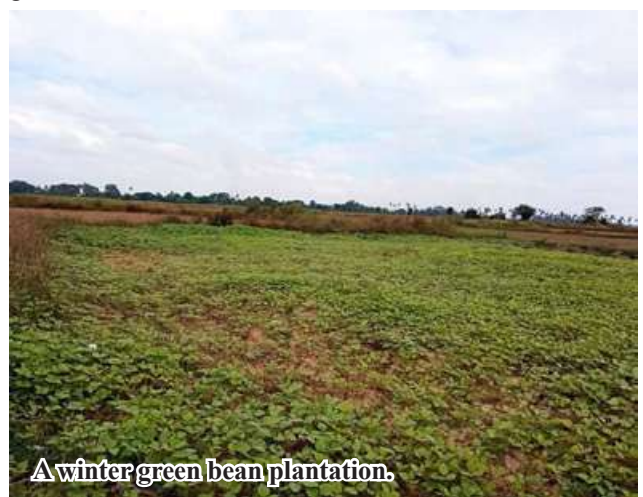
A winter green bean plantation.