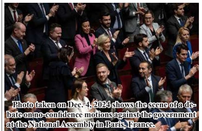
Photo taken on Dec. 4, 2024 shows the scene of a debate on no-confidence motions against the government at the National Assembly in Paris, France.

This year, township authorities arrange sale of quality seeds and urea fertilizers to local farmers at fair prices. 206