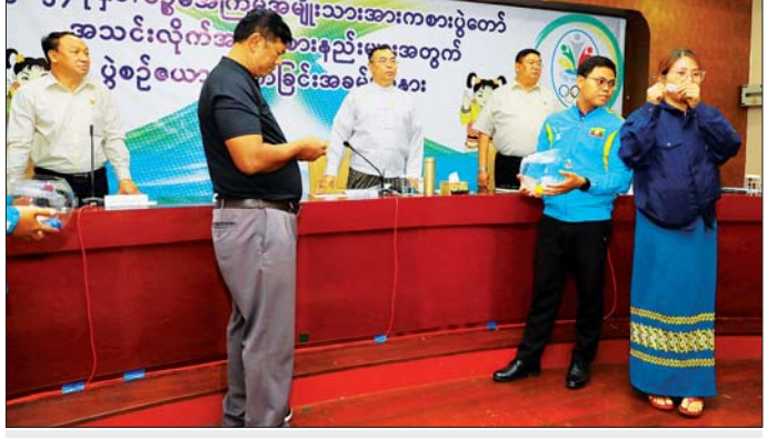
၂၀၂၄ ခုနှစ် ပဉ္စမအကြိမ် အမျိုးသားအားကစားပွဲတော် အားကစားနည်း ၁၀ နည်းအတွက် အုပ်စုခွဲနှိုက်ခြင်းများ ဆောင်ရွက်စဉ်။

စည်းမျဉ်း/စည်းကမ်းများအတိုင်း လိုက်နာစေရေး ကြပ်မတ်ဆောင်ရွက်သွားရန်ဖြစ်ကြောင်း ပြောကြားသည်။ အုပ်စုခွဲနှိုက် ဆက်လက်ပြီး ၂၀၂၄ ခုနှစ် ပဉ္စမအကြိမ် အမျိုးသားအားကစားပွဲတော် ပြိုင်ပွဲကျင်းပရေးနှင့် နည်းစနစ်ဆိုင်ရာမတီအတွင်း ရေးရာ၊ အသင်းလိုက်အားကစားနည်းများဖြစ်သည့် ဘောလုံး၊ ဖူဆယ်၊ ဘော်လီဘော၊ ဘတ်စကက်ဘော၊ ပိုက်ကျော်ခြင်း၊ ကြက်တောင်၊ ရိုးရာခြင်းလုံး၊ စားပွဲတင်တင်းနစ်၊ တင်းနစ်နှင့် ခရစ်ကက် အားကစားနည်း ၁၀ နည်းတို့၏ အုပ်စုခွဲနှိုက်ခြင်းများကို ဆောင်ရွက်သည်။ အဆိုပါ အစည်းအဝေးသို့ ညွှန်ကြားရေးမှူးချုပ်နှင့် တာဝန်ရှိသူများ၊ သက်ဆိုင်ရာအားကစားအဖွဲ့ချုပ်များမှ တာဝန်ရှိသူများနှင့် ပြည်နယ်နှင့် တိုင်းဒေသကြီးများမှ တာဝန်ခံ ကိုယ်စားလှယ်များ တက်ရောက်ခဲ့ကြောင်း သိရသည်။ သတင်းစဉ်