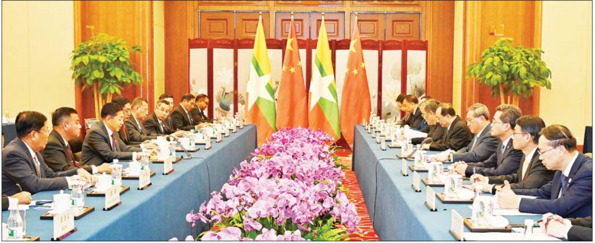
နိုင်ငံတော်စီမံအုပ်ချုပ်ရေးကောင်စီဥက္ကဋ္ဌ နိုင်ငံတော်ဝန်ကြီးချုပ် ဗိုလ်ချုပ်မှူးကြီး မင်းအောင်လှိုင်နှင့် တရုတ်ပြည်သူ့သမ္မတနိုင်ငံ ဝန်ကြီးချုပ် H.E. Mr. Li Qiang တို့ တွေ့ဆုံဆွေးနွေးစဉ်။

နေပြည်တော် နိုဝင်ဘာ ၆ တရုတ်ပြည်သူ့သမ္မတနိုင်ငံ အစိုးရ၏ ဖိတ်ကြားချက်အရ ထိပ်သီးအစည်းအဝေးများ တက်ရောက်ရန် တရုတ်ပြည်သူ့သမ္မတနိုင်ငံ၌ ရောက်ရှိနေသည့် နိုင်ငံတော် စီမံအုပ်ချုပ်ရေးကောင်စီဥက္ကဋ္ဌ နိုင်ငံတော်ဝန်ကြီးချုပ် ဗိုလ်ချုပ်မှူးကြီး မင်းအောင်လှိုင်သည် တရုတ်ပြည်သူ့သမ္မတနိုင်ငံ ဝန်ကြီးချုပ် H.E. Mr. Li Qiang နှင့်အဖွဲ့အား ယနေ့မွန်းလွဲပိုင်းတွင် တရုတ်ပြည်သူ့သမ္မတနိုင်ငံ ကူမင်းမြို့ရှိ Haigeng Garden Hotel ၌ တွေ့ဆုံသည်။ ဦးစွာ နိုင်ငံတော်စီမံအုပ်ချုပ်ရေးကောင်စီဥက္ကဋ္ဌ နိုင်ငံတော် ဝန်ကြီးချုပ်အား စာမျက်နှာ ၅ ကော်လံ ၁ □