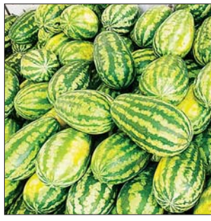
၆ - ၁၁ - ၂၀၂၄ ရက်နေ့ တိုင်းဒေသကြီးနှင့် ပြည်နယ် မြို့နယ်အလိုက် ဆန်၊ ဆီ၊ မီးဖိုချောင်သုံးပစ္စည်းများ၊ သားငါး၊ ဈေးနှုန်းများ