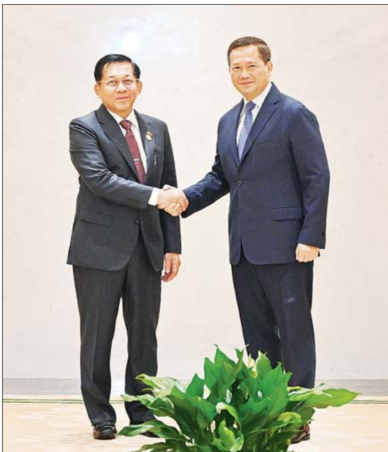
နိုင်ငံတော်စီမံအုပ်ချုပ်ရေးကောင်စီဥက္ကဋ္ဌ နိုင်ငံတော်ဝန်ကြီးချုပ် ဗိုလ်ချုပ်မှူးကြီး မင်းအောင်လှိုင်နှင့် ကမ္ဘောဒီးယားနိုင်ငံဝန်ကြီးချုပ် H.E. Mr. Hun Manet တို့ ရင်းရင်းနှီးနှီး နှုတ်ဆက်စဉ်။

တွေ့ဆုံဆွေးနွေး ထိုသို့ တွေ့ဆုံဆွေးနွေးရာ၌ နိုင်ငံတော်စီမံအုပ်ချုပ်ရေးကောင်စီ ဥက္ကဋ္ဌ နိုင်ငံတော်ဝန်ကြီးချုပ်သည် နံနက်ပိုင်းတွင် ကမ္ဘောဒီးယားနိုင်ငံ ဝန်ကြီးချုပ် H.E. Mr. Hun Manet နှင့်အဖွဲ့ဝင်များအား Green Lake ဟိုတယ်၌လည်းကောင်း၊ လာအို နိုင်ငံဝန်ကြီးချုပ် H.E. Mr. Sonexay Siphandone နှင့် အဖွဲ့ဝင်များအား HUALUXE Kunming ဟိုတယ်၌လည်းကောင်း သီးခြားစီ တွေ့ဆုံဆွေးနွေး သည်။