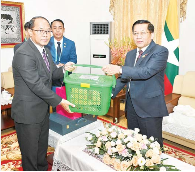
နိုင်ငံတော်စီမံအုပ်ချုပ်ရေးကောင်စီဥက္ကဋ္ဌ နိုင်ငံတော်ဝန်ကြီးချုပ် ဗိုလ်ချုပ်မှူးကြီး မင်းအောင်လှိုင် ကောင်စစ်ဝန်ချုပ်ရုံး ဝန်ထမ်းမိသားစုများနှင့်ပညာတော် သင်ကြားလျက်ရှိသည့် မြန်မာနိုင်ငံမှ စစ်ဘက်၊ အရပ်ဘက် သင်တန်းသား၊ သင်တန်းသူများအတွက် လက်ဆောင်ပစ္စည်းများနှင့် ချီးမြှင့်ထောက်ပံ့ငွေများကို လေးအပ်စဉ်။

နေပြည်တော် နိုဝင်ဘာ ၆ တရုတ်ပြည်သူ့သမ္မတနိုင်ငံ ကူမင်းမြို့သို့ရောက်ရှိနေသည့် နိုင်ငံတော်စီမံအုပ်ချုပ်ရေးကောင်စီ ဥက္ကဋ္ဌ နိုင်ငံတော်ဝန်ကြီးချုပ် ဗိုလ်ချုပ်မှူးကြီး မင်းအောင်လှိုင်သည် ယနေ့နံနက်ပိုင်းတွင် ကူမင်းမြို့ရှိ မြန်မာ့ကောင်စစ်ဝန်ချုပ်ရုံး ဝန်ထမ်းမိသားစုများနှင့် ပညာတော်သင် သင်တန်းသားများအား တွေ့ဆုံအမှာစကား ပြောကြားသည်။