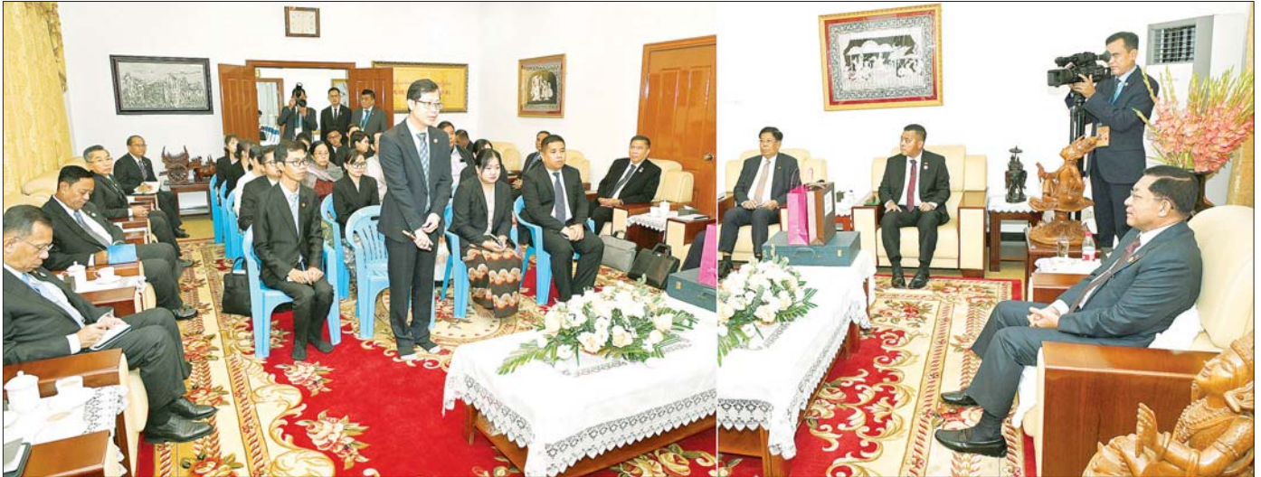
နိုင်ငံတော်စီမံအုပ်ချုပ်ရေးကောင်စီဥက္ကဋ္ဌ နိုင်ငံတော်ဝန်ကြီးချုပ် ဗိုလ်ချုပ်မှူးကြီး မင်းအောင်လှိုင် ကူမင်းမြို့ရှိ မြန်မာ့ကောင်စစ်ဝန်ချုပ်ရုံး ဝန်ထမ်းမိသားစုများနှင့် ပညာတော်သင် သင်တန်းသားများအား တွေ့ဆုံအမှာစကားပြောကြားစဉ်။