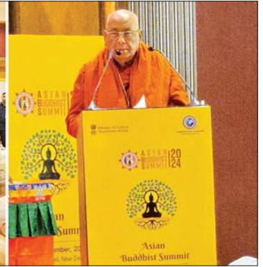
ပညာရှင်များ စုစုပေါင်း ၁၀၀၀ ခန့် တော်ကြီးက ဘုရားပန်းကပ်ခြင်း၊ ဆီမီး ထိုးနှံခြင်းများပြုလုပ်၍ အခမ်းအနား တွန်းကြားပေးကြသည်။ ထို့နောက် ဆရာတော်ကြီးက Recognition of Pali as a Classical Indian Language အကြောင်း မိန့်ခွန်း ပြောကြားပြီး ညနေပိုင်းတွင် အခမ်းအနား ကို ရုပ်သိမ်းလိုက်သည်။