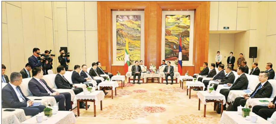
နိုင်ငံတော်စီမံအုပ်ချုပ်ရေးကောင်စီဥက္ကဋ္ဌ နိုင်ငံတော်ဝန်ကြီးချုပ် ဗိုလ်ချုပ်မှူးကြီး မင်းအောင်လှိုင်နှင့် လာအိုနိုင်ငံဝန်ကြီးချုပ် H.E. Mr. Sonexay Siphandone တို့ တွေ့ဆုံဆွေးနွေးစဉ်။

အမြင်ချင်းဖလှယ်ဆွေးနွေး တွေ့ဆုံစဉ် မြန်မာနိုင်ငံနှင့် ကမ္ဘောဒီးယား၊ လာအိုနိုင်ငံတို့ အကြား ချစ်ကြည်ရင်းနှီးမှုနှင့် ပူးပေါင်း ဆောင်ရွက်မှုများကို တိုးမြှင့်ဆောင်ရွက်နိုင်မည့် အခြေ အနေများ၊ မြန်မာနိုင်ငံ၏ နိုင်ငံရေး ဖြစ်ပေါ်ပြောင်းလဲမှု အခြေအနေ များနှင့် လက်ရှိပတ်ဝန်းကျင်အခြေအနေ များ၊ လွတ်လပ်၍တရားမျှတသည့် ပါတီစုံ ဒီမိုကရေစီအထွေထွေ ရှေးကောက်ပွဲတစ်ရပ် ကျင်းပနိုင် ရေး ဆောင်ရွက်လျက်ရှိသည့် အခြေအနေများ၊ အာဆီယံအဖွဲ့ အတွင်း မြန်မာနိုင်ငံအနေဖြင့် အကောင်းဆုံး ပူးပေါင်းဆောင် ရွက်လျက်ရှိမှု အခြေအနေများ၊ အာဆီယံအစည်းအဝေးများတွင်