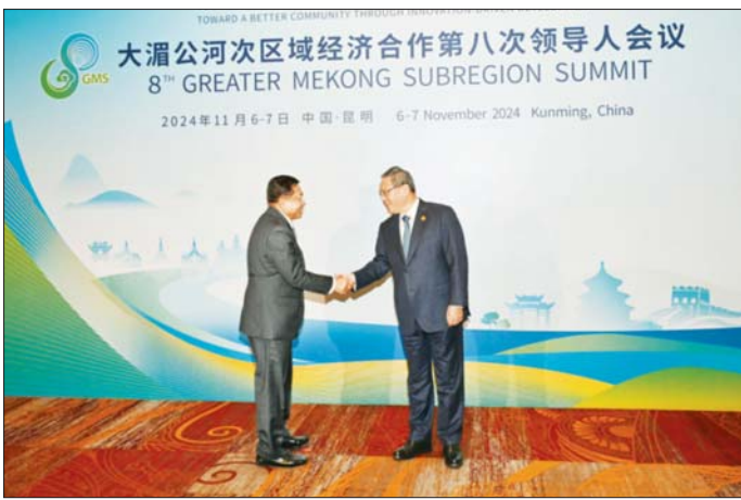
(၈) ကြိမ်မြောက် မဟာမဲခေါင်ဒေသခွဲ ထိပ်သီးအစည်းအဝေး 8 th Greater Mekong Subregion Economic Cooperation Program (GMS) Summit ကြိုဆိုညှစ်စာစားပွဲအခမ်းအနားသို့ နိုင်ငံတော်စီမံ အုပ်ချုပ်ရေးကောင်စီဥက္ကဋ္ဌ နိုင်ငံတော်ဝန်ကြီးချုပ် ဗိုလ်ချုပ်မှူးကြီး မင်းအောင်လှိုင် တက်ရောက်ရာ တရုတ်ပြည်သူ့သမ္မတနိုင်ငံ ဝန်ကြီးချုပ် H.E. Mr. Li Qiang က ကြိုဆိုနှုတ်ဆက်စဉ်။

ထို့နောက် တရုတ်ပြည်သူ သမ္မတနိုင်ငံ ဝန်ကြီးချုပ်က မြန်မာ နိုင်ငံ၏ ပြည်တွင်းတည်ငြိမ် အေးချမ်းရေးအတွက် တရုတ် နိုင်ငံအနေဖြင့် အပြည့်အဝ ထောက်ခံအားပေး ကူညီသွားမည် ဖြစ်ပြီး အိမ်နီးချင်းကောင်းနဲ့ နိုင်ငံ အဖြစ် ထာဝရတည်တံ့သွားမည် ဖြစ်ကြောင်း၊ မြန်မာအစိုးရအနေ ဖြင့် ဖြစ်ပေါ်နေသည့် လက်နက် ကိုင်ပဋိပက္ခများကို အကြမ်းဖက်