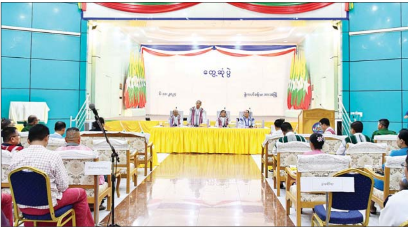
နိုင်ငံတော်စီမံအုပ်ချုပ်ရေးကောင်စီအဖွဲ့ဝင် မန်းငြိမ်းမောင် ကရင်ပြည်နယ်အတွင်းရှိ တိုင်းရင်းသားလက်နက်ကိုင် ငြိမ်းချမ်းရေးအဖွဲ့အစည်းများ၊ နိုင်ငံရေးပါတီများ၊ တိုင်းရင်းသားစာပေနှင့် ယဉ်ကျေးမှုအဖွဲ့များ၊ ရုပ်မိရပ်ဖများ၊ လူမှုရေးအသင်းအဖွဲ့များ၊ ဌာနဆိုင်ရာများ၊ အလှူပေါင်းစုံမှ ဒေသခံတိုင်းရင်းသားပြည်သူများအား တွေ့ဆုံပြောကြားစဉ်။

နေပြည်တော် နိုဝင်ဘာ ၆ နိုင်ငံတော် စီမံအုပ်ချုပ်ရေးကောင်စီ အဖွဲ့ဝင် မန်းငြိမ်းမောင်နှင့် ခွန်စံလွင်၊ တိုင်းရင်းသားလူမျိုးများရေးရာ ဝန်ကြီးဌာန ပြည်ထောင်စုဝန်ကြီး Jeng Phang နော်တောင်၊ ကရင်ပြည်နယ်ဝန်ကြီးချုပ် ဦးစောမြင့်ဦး၊ နိုင်ငံတော်စီမံအုပ်ချုပ်ရေးကောင်စီ ဗဟိုအကြံပေးအဖွဲ့ခေါင်းဆောင် ဦးစောထွန်းအောင်နှင့် တာဝန်ရှိသူများသည် ယနေ့ မွန်းလွဲပိုင်းတွင် ကရင်ပြည်နယ် ဘားအံမြို့၊ စွဲကပင်ခန်းမ၌ ပြည်နယ်အတွင်းရှိ တိုင်းရင်းသားလက်နက်ကိုင် ငြိမ်းချမ်းရေး အဖွဲ့အစည်းများ၊ နိုင်ငံရေးပါတီများ၊ တိုင်းရင်းသားစာပေနှင့် ယဉ်ကျေးမှုအဖွဲ့များ၊ ရုပ်မိရပ်ဖများ၊ လူမှုရေးအသင်းအဖွဲ့များ၊ ဌာနဆိုင်ရာများ၊ အလှူပေါင်းစုံမှ ဒေသခံတိုင်းရင်းသားပြည်သူများနှင့် တွေ့ဆုံသည်။ အားလုံးပူးပေါင်းပါဝင်ဆောင်ရွက်ရေး တိုင်းရင်းသားအဖွဲ့ဝင် နိုင်ငံတော်စီမံအုပ်ချုပ်ရေးကောင်စီအဖွဲ့ဝင် မန်းငြိမ်းမောင်က နိုင်ငံတော်စီမံအုပ်ချုပ်ရေးကောင်စီ၏ နိုင်ငံတည်ငြိမ်အေးချမ်း ဖွံ့ဖြိုးတိုးတက်ရေးဆောင်ရွက်နေမှု၊ ငြိမ်းချမ်းရေးလုပ်ငန်းစဉ် ဖော်ဆောင်နေမှုနှင့် စပ်လျဉ်း၍လည်းကောင်း၊ နိုင်ငံတော်စီမံအုပ်ချုပ်ရေးကောင်စီအဖွဲ့ဝင် ခွန်စံလွင်က