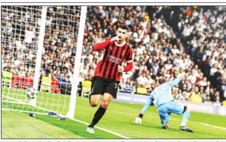
အေစီစီလန်တိုက်စစ်ကစားသမား ဖိုရာတာ ရိုးရဲမက်ဒရစ်အသင်းဘက်သို့ ပိုးသွင်းယူပြီးနောက် အောင်ပွဲခံစဉ်။