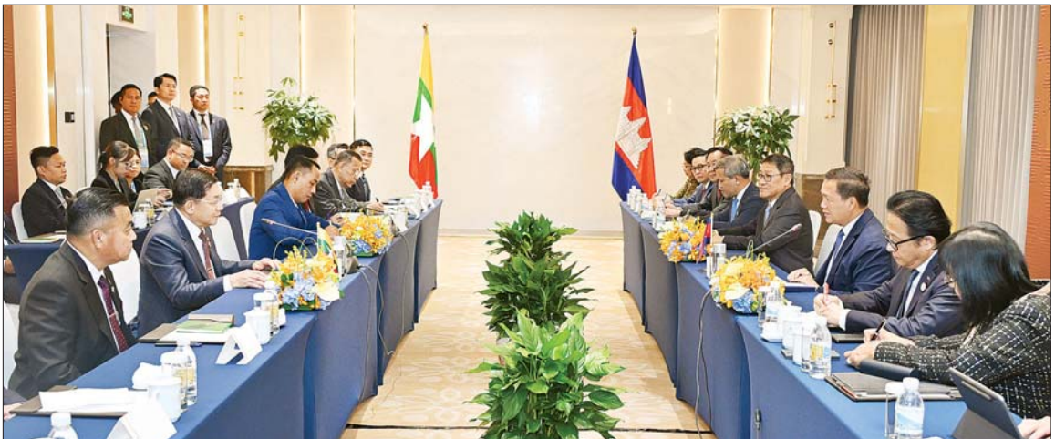
နိုင်ငံတော်စီမံအုပ်ချုပ်ရေးကောင်စီဥက္ကဋ္ဌ နိုင်ငံတော်ဝန်ကြီးချုပ် ဗိုလ်ချုပ်မှူးကြီး မင်းအောင်လှိုင်နှင့် ကမ္ဘောဒီးယားနိုင်ငံ ဝန်ကြီးချုပ် H.E. Mr. Hun Manet တို့ တွေ့ဆုံဆွေးနွေးစဉ်။

နေပြည်တော် နိုဝင်ဘာ ၆ နိုင်ငံတော်စီမံအုပ်ချုပ်ရေးကောင်စီ ဥက္ကဋ္ဌ နိုင်ငံတော်ဝန်ကြီးချုပ် ဗိုလ်ချုပ်မှူးကြီး မင်းအောင်လှိုင် သည် ယနေ့တွင် တရုတ်ပြည်သူ့ သမ္မတနိုင်ငံ ကူမင်းမြို့၌ ကျင်းပ ပြုလုပ်မည့် အဋ္ဌမဟာမိတ်မြောက် မဟာမိတ်ခေါင်းဆောင်မှု ထိပ်သီး အစည်းအဝေးအပေါ်အင် ထိပ်သီး အစည်းအဝေးများသို့ တက်ရောက် ရန် ရောက်ရှိနေသည့် ဝန်ကြီးချုပ် များနှင့် တွေ့ဆုံဆွေးနွေးသည်။