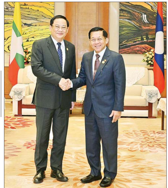
နိုင်ငံတော်စီမံအုပ်ချုပ်ရေးကောင်စီဥက္ကဋ္ဌ နိုင်ငံတော်ဝန်ကြီးချုပ် ဗိုလ်ချုပ်မှူးကြီး မင်းအောင်လှိုင်နှင့် လာအိုနိုင်ငံဝန်ကြီးချုပ် H.E. Mr. Sonexay Siphandone တို့ ရင်းရင်းနှီးနှီး နှုတ်ဆက်စဉ်။

အမြင်ချင်းဖလှယ်ဆွေးနွေး တွေ့ဆုံစဉ် မြန်မာနိုင်ငံနှင့် ကမ္ဘောဒီးယား၊ လာအိုနိုင်ငံတို့ အကြား ချစ်ကြည်ရင်းနှီးမှုနှင့် ပူးပေါင်း ဆောင်ရွက်မှုများကို တိုးမြှင့်ဆောင်ရွက်နိုင်မည့် အခြေ အနေများ၊ မြန်မာနိုင်ငံ၏ နိုင်ငံရေး ဖြစ်ပေါ်ပြောင်းလဲမှု အခြေအနေ များနှင့် လက်ရှိပတ်ဝန်းကျင်အခြေအနေ များ၊ လွတ်လပ်၍တရားမျှတသည့် ပါတီစုံ ဒီမိုကရေစီအထွေထွေ ရှေးကောက်ပွဲတစ်ရပ် ကျင်းပနိုင် ရေး ဆောင်ရွက်လျက်ရှိသည့် အခြေအနေများ၊ အာဆီယံအဖွဲ့ အတွင်း မြန်မာနိုင်ငံအနေဖြင့် အကောင်းဆုံး ပူးပေါင်းဆောင် ရွက်လျက်ရှိမှု အခြေအနေများ၊ အာဆီယံအစည်းအဝေးများတွင်