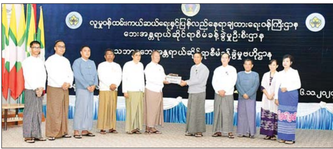
သဘာဝ ဘေးအန္တရာယ်ဆိုင်ရာ ဝန်ကြီး ခေါက်တာစိုးဝင်းက တင်စကား ပြောကြားခဲ့ကြောင်း သတင်းစဉ်

နေပြည်တော် နိုဝင်ဘာ ၆ ရာဂီတိုင်ဖွန်းမှန်တိုင်းနှင့် ဆက်စပ် ဖြစ်ပွားသော ရေကြီးရေလျှံမှုများ ကြောင့် ရေဘေးဒဏ်ခံစားရသော ဒေသများအတွက် ရုရှား-မြန်မာ စီးပွားရေးကောင်စီ (Russian-Myanmar Business Council-RMBC) မှ လှူဒါန်းသည့် အမေရိကန် ဒေါ်လာ ၅၀၀၀ ကို ယနေ့ဖွင့်လှစ် ပိုင်းတွင် ပြည်ထောင်စုရာထူးဝန် အဖွဲ့ဥက္ကဋ္ဌ ဦးအောင်သော်နှင့် အသင်းဝင်များက လူမှုဝန်ထမ်း၊ ကယ်ဆယ်ရေးနှင့် ပြန်လည် နေရာချထားရေး ဝန်ကြီးဌာန၊