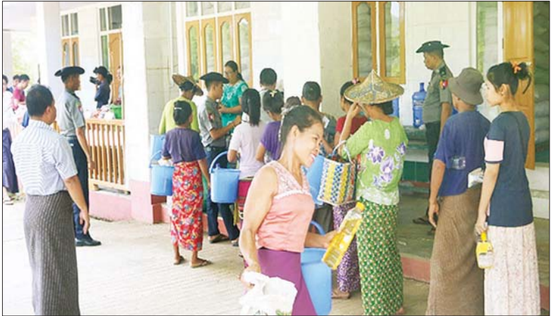
အမ်းမြို့နယ်အတွင်းရှိ ဒေသခံပြည်သူများအား အခြေခံစားသောက်ကုန်ပစ္စည်းများ သက်သာသောဈေးနှုန်းဖြင့် ရောင်းချပေးစဉ်။

နေပြည်တော် မေ ၃၀ ရခိုင်ပြည်နယ်အတွင်း AA အကြမ်းဖက် သောင်းကျန်းသူများက အကြမ်းဖက်လုပ်ရပ်များ လုပ်ဆောင်လျက် ရှိသည့်အပြင် ဆက်သွယ်ရေး လမ်းကြောင်းများ အား နှည်းမျိုးစုံဖြင့် ဖြတ်တောက်ပိတ်ဆို့ခြင်းများ လုပ်ဆောင်လျက် ရှိသဖြင့် လုံခြုံရေးတပ်ဖွဲ့ဝင်များက အဆိုပါဒေသ တည်ငြိမ်အေးချမ်းရေးနှင့် လမ်းပန်းဆက်သွယ်ရေး လုံခြုံချောမွေ့စေရေးတို့အတွက် ကြိုးပမ်းဆောင်ရွက်လျက်ရှိသည်။ ထိုသို့ ဆောင်ရွက်ပေးရာတွင် နိုင်ငံတော်စီမံအုပ်ချုပ်ရေးကောင်စီ၏စီစဉ်ဆောင်ရွက်ပေးမှုဖြင့် အမ်းခရိုင်ရှိ ဒေသခံပြည်သူများအတွက် စာမျက်နှာ ၉ ကော်လံ ၁ ❖