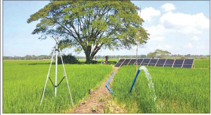
ဟင်္သာတမြို့နယ် ဆိုလာစိုက်ပျိုးရေးရရှိရေးအတွက် ဆိုလာပြားများဖြင့် လက်တွေ့ရေတင်နေမှု။

သည် ကျေးလက်အသက်မွေးဝမ်းကျောင်း ဖွံ့ဖြိုးရေးနှင့် မိသားစုဝင်ငွေတိုးပွားရေးကို ထိုကဲ့သို့ ကြိုးပမ်းဖော်ဆောင်နေသည့်အပြင် ကျေးလက်ရေရရှိရေး၊ ကျေးလက်မီးလင်းရေး၊ ကျေးလက်ကုန်ထုတ်လုပ်ရေးနှင့် ကုန်ထုတ်တံတားများ တည်ဆောက်ခြင်း၊ ကျေးလက်အိမ်ရာ တည်ဆောက်ခြင်း စသည့်အခြေခံအဆောက်အအုံ ဖွံ့ဖြိုးရေးလုပ်ငန်းများစွာကိုလည်း တစ်ချိန်တည်း ဖော်ဆောင်ပေးလျက်ရှိပါသည်။ ကျေးလက်ရေရရှိရေးလုပ်ငန်း ၁၇၈၀ ၊ ကျေးလက်မီးလင်းရေးလုပ်ငန်း ကျေးရွာ ၉၄၀ ၊ ဆိုလာစိုက်ပျိုးရေးတင် စနစ်လုပ်ငန်း ၉၈ ခု၊ ကျေးလက်ကုန်ထုတ်လမ်း (၅၃၂/၁.၄) မိုင်၊ ကျေးလက်ကုန်ထုတ်တံတား ၁၁၅၉ စင်း၊ ကျေးလက်အိမ်ရာ ၃၂ လုံးကို စာမျက်နှာ ၁၁ သို့