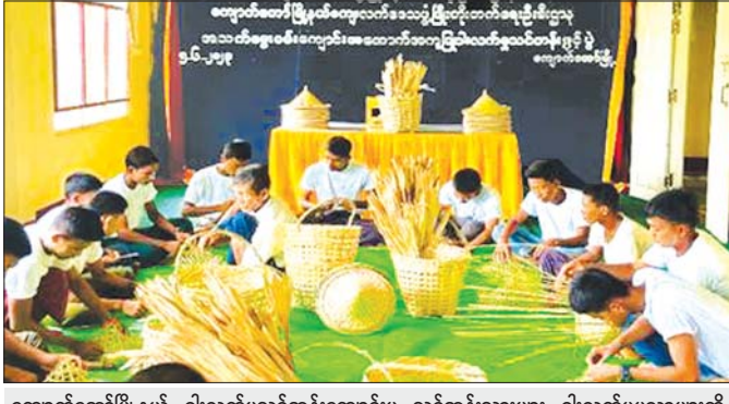
ကျောက်တော်မြို့နယ် ဝါးလက်မူသင်တန်းကျောင်းမှ သင်တန်းသားများ ဝါးလက်မူပညာများကို လက်တွေ့ရက်လုပ်။