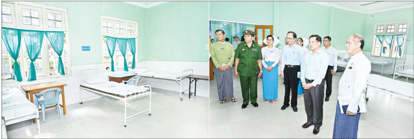
နိုင်ငံတော်စီမံအုပ်ချုပ်ရေးကောင်စီဥက္ကဋ္ဌ နိုင်ငံတော်ဝန်ကြီးချုပ် ဗိုလ်ချုပ်မှူးကြီး မင်းအောင်လှိုင် အကြမ်းဖက်သောင်းကျန်းသူများ၏ ရှေ့တိုက်ခုံဖြင့် ပစ်ခတ်တိုက်ခိုက်မှုကြောင့် ထိခိုက်ပျက်စီးခဲ့ရသည့် အရိုးအကြောကုသဆောင် ပြင်ဆင်ထားရှိမှု ကြည့်ရှုစစ်ဆေးစဉ်။