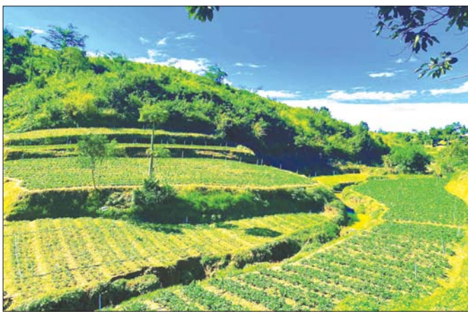
ပြင်ဦးလွင်မြို့နယ် ဆင်ဖြူအင်းကျေးရွာ စတော်ဘယ်ရီစိုက်ပျိုးရေး (RBF)

လုပ်ငန်းအလိုက် ဖွံ့ဖြိုးမှုရရှိစေရန် ဆောင်ရွက်နိုင်ခဲ့ပြီးခဲ့သည့် ၂၀၂၃-၂၀၂၄ ဘဏ္ဍာနှစ်တစ်နှစ်အတွင်းပင်လျှင် မြစ်စိမ်းရောင်ကျေးရွာစီမံကိန်းထပ်တိုးကျေးရွာ ၂၄၆ ရွာအပါအဝင် ကျေးရွာ ၁၄၉၅၈ ရွာ၊ Digital Payment စနစ်ဖြင့် ကျေးရွာ ၂၄၃ ကျေးရွာဖွံ့ဖြိုးတိုးတက်ရေး လုပ်ငန်းစီမံကိန်း ကျေးရွာ ၁၈၆၄ ရွာ၊ ခေတ်စီမံပြုကျေးရွာထူထောင်ခြင်း စီမံကိန်းကျေးရွာ ၈၈ ရွာ၊ ကျေးလက်စီးပွားဖြင့်မားရေးရန်ပုံငွေထူထောင်ခြင်း လုပ်ငန်းကျေးရွာ ၉၁ ရွာ၊ Cash for Work စီမံကိန်း ကျေးရွာ ၉၈ ရွာတို့တွင် လုပ်ငန်းရပ်အလိုက် ဖွံ့ဖြိုးမှုရရှိစေရန် ကျေးလက်ဒေသဖွံ့ဖြိုးတိုးတက်ရေးဦးစီးဌာနသည် ကြိုးပမ်းဆောင်ရွက်နိုင်ခဲ့ပါသည်။ ကျေးလက်ဒေသ ဖွံ့ဖြိုးတိုးတက်ရေးဦးစီးဌာန