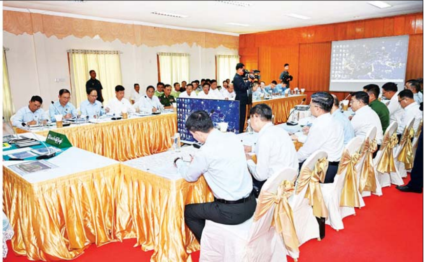
နိုင်ငံတော်စီမံအုပ်ချုပ်ရေးကောင်စီဥက္ကဋ္ဌ နိုင်ငံတော်ဝန်ကြီးချုပ် ဗိုလ်ချုပ်မှူးကြီး မင်းအောင်လှိုင် ပြင်ဦးလွင်ခရိုင်နှင့် မြို့နယ်အတွင်းရှိ ဌာနဆိုင်ရာဝန်ထမ်းများအား တွေ့ဆုံ၍ ပြင်ဦးလွင်မြို့ သာယာလှပရေး၊ ဖွံ့ဖြိုးတိုးတက်ရေးနှင့် ကော်ဖီတိုးချဲ့စိုက်ပျိုးနိုင်ရေးဆိုင်ရာ ကိစ္စရပ်များကို ဆွေးနွေးမှာကြားစဉ်။