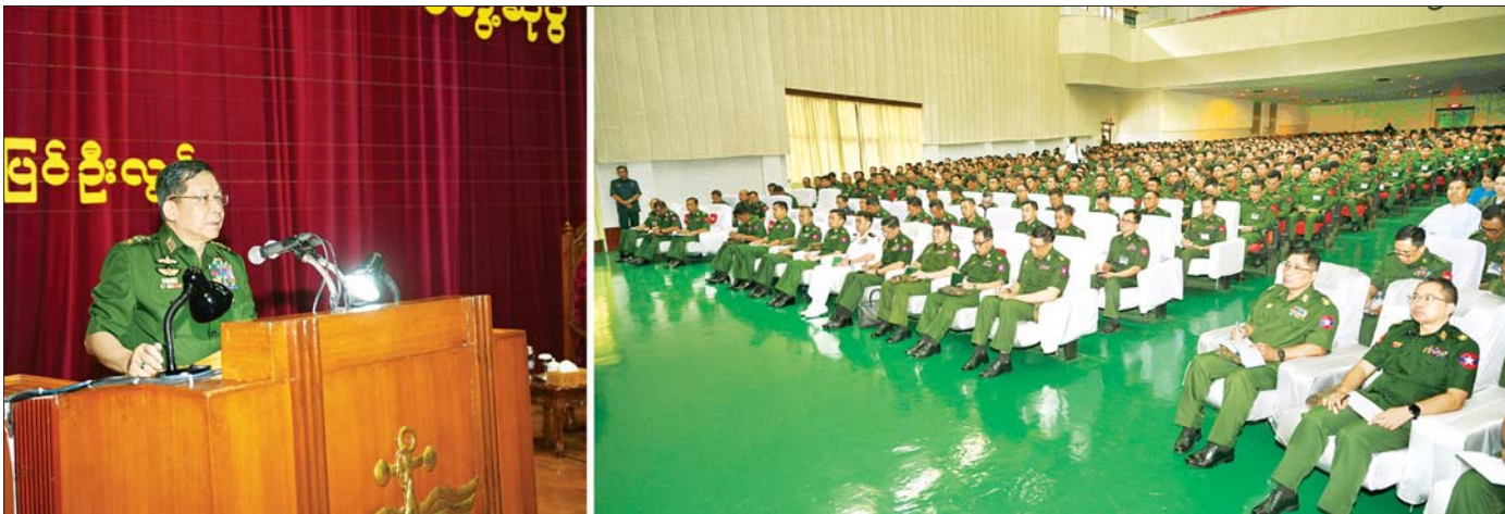
နိုင်ငံတော်စီမံအုပ်ချုပ်ရေးကောင်စီဥက္ကဋ္ဌ တပ်မတော်ကာကွယ်ရေးဦးစီးချုပ် ဗိုလ်ချုပ်မှူးကြီး မင်းအောင်လှိုင် စစ်တက္ကသိုလ်မှ နည်းပြအရာရှိကြီးများ၊ ကထိကအရာရှိကြီးများ၊ ဆရာကြီး၊ ဆရာမကြီးများ၊ သန္ဓေအရာရှိများ၊ သင်တန်းသား၊ သင်တန်းသူများနှင့် ဗိုလ်လောင်းများအား တွေ့ဆုံအမှာစကားပြောကြားစဉ်။

နိုင်ငံတော်စီမံအုပ်ချုပ်ရေးကောင်စီဥက္ကဋ္ဌ တပ်မတော်ကာကွယ်ရေးဦးစီးချုပ် ဗိုလ်ချုပ်မှူးကြီး မင်းအောင်လှိုင် စစ်တက္ကသိုလ်မှ နည်းပြအရာရှိကြီးများ၊ ကထိကအရာရှိကြီးများ၊ ဆရာကြီး၊ ဆရာမကြီးများ၊ သန္ဓေအရာရှိများ၊ သင်တန်းသား၊ သင်တန်းသူများနှင့် ဗိုလ်လောင်းများအား တွေ့ဆုံအမှာစကားပြောကြား သင်တန်းသားများအနေဖြင့် မိမိတို့ဘဝ တိုးတက်ရေး နိုင်ငံတော်နှင့် တပ်မတော်၏ မျှော်မှန်းချက်များ မပျောက်ပျက်စေရေးတို့အတွက် စည်းကမ်းစနစ်တကျဖြင့် မိမိကိုယ်ကိုစောင့်ထိန်း၍ ပညာကို ကြိုးပမ်းသင်ကြား