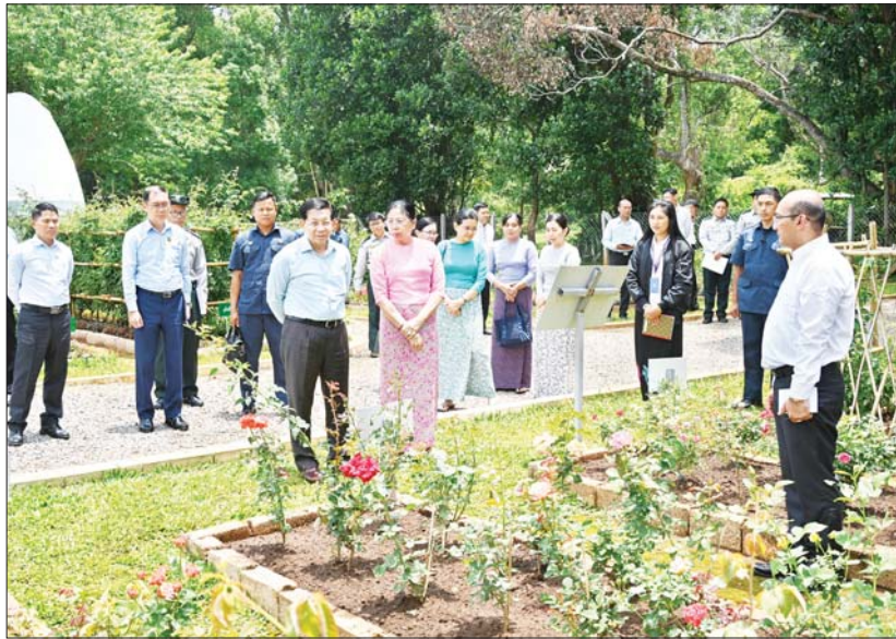
နိုင်ငံတော်စီမံအုပ်ချုပ်ရေးကောင်စီဥက္ကဋ္ဌ နိုင်ငံတော်ဝန်ကြီးချုပ် ဗိုလ်ချုပ်မှူးကြီး မင်းအောင်လှိုင်နှင့် ဇနီး ဒေါ်ကြာကြာလှ အမျိုးသားကန်တော်ကြီးဥယျာဉ်အတွင်း လှည့်လည်ကြည့်ရှုစစ်ဆေးစဉ်။

နေပြည်တော် မေ ၃၀ နိုင်ငံတော်စီမံအုပ်ချုပ်ရေး ကောင်စီဥက္ကဋ္ဌ နိုင်ငံတော်ဝန်ကြီးချုပ် ဗိုလ်ချုပ်မှူးကြီး မင်းအောင်လှိုင် သည် ယနေ့နံနက်ပိုင်းတွင် မန္တလေးတိုင်းဒေသကြီး ပြင်ဦးလွင်ခရိုင်နှင့် မြို့နယ်အတွင်းရှိ ဌာနဆိုင်ရာဝန်ထမ်းများအား ပြင်ဦးလွင်မြို့၊ အမျိုးသားအထိမ်းအမှတ်ဥယျာဉ်ရှိ အစည်းအဝေးခန်းမ၌ တွေ့ဆုံ၍ ပြင်ဦးလွင်မြို့ သာယာလှပရေး၊ ဖွံ့ဖြိုးတိုးတက်ရေးနှင့် ကော်ဖီတိုးချဲ့စိုက်ပျိုးနိုင်ရေးဆိုင်ရာ ကိစ္စရပ်များကို ဆွေးနွေးမှာကြားသည်။ အဆိုပါ တွေ့ဆုံပွဲသို့ နိုင်ငံတော်စီမံအုပ်ချုပ်ရေးကောင်စီဥက္ကဋ္ဌ နိုင်ငံတော်ဝန်ကြီးချုပ်နှင့်အတူ ပြည်ထောင်စုဝန်ကြီးများဖြစ်ကြသည့် ဦးမင်းနောင်၊ ဦးခင်မောင်ရှိနှင့် ဒေါက်တာ သက်ခိုင်ဝင်း၊ မန္တလေးတိုင်းဒေသကြီး ဝန်ကြီးချုပ် ဦးမျိုးအောင်၊ ကာကွယ်ရေးဦးစီးချုပ်မှူးမှ အဆင့်မြင့် တပ်မတော်အရာရှိကြီးများ၊ အလယ်ပိုင်း တိုင်းစစ်ဌာနချုပ် တိုင်းမှူး၊ ပြင်ဦးလွင်ခရိုင်နှင့် မြို့နယ်အတွင်းရှိ ဌာနဆိုင်ရာဝန်ထမ်းများနှင့် တာဝန်ရှိသူများ တက်ရောက်ကြသည်။ သဘာဝပတ်ဝန်းကျင်ပျက်စီးဆုံးရှုံးမှုများကို ပြန်လည်ပြုပြင်ထိန်းသိမ်းရန်လိုအပ်ပြီး ဦးစွာ နိုင်ငံတော်စီမံအုပ်ချုပ်ရေးကောင်စီဥက္ကဋ္ဌ နိုင်ငံတော်ဝန်ကြီးချုပ်က အမှာစကားပြောကြားရာတွင် ပြင်ဦးလွင်