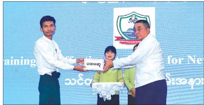
ဒီဂရီကောလိပ် တာဝန်ခံ အခြေအနေကို ရှင်းလင်းတင်ပြပြီး ကျောင်းအုပ် ဒေါ်ငွေနုလှနုမှ သင်တန်းတွင် ဆုရရှိသူများ က သင်တန်းတက်ရောက်ခဲ့သည့် ပြည်နယ်ဝန်ကြီးချုပ်နှင့် အဖွဲ့ဝင် က သင်တန်းသား သင်တန်းသူများ၏ များက ဆုများပေးအပ်ချီးမြှင့်ပြီး နောက်သင်တန်းသားများအတွက် သင်တန်းဆင်း လက်မှတ်များ ပေးအပ်ခဲ့ကြောင်း သိရသည်။ ခရိုင်(ပြန်/ဆက်)

ဖြစ်ကြောင်းနှင့် သင်တန်းတွင် ပို့ချသည့် အခြေခံ အင်္ဂလိပ်စာ သင်ကြားခြင်းအတွက် အရေးကြီးသော အခြေခံများကို အသုံးပြုရင်း ၂၁ ရာစုပညာရေး၏ C ငါးလုံး ဖြစ်သော ဝေဖန်ပိုင်းခြားတွေးခေါ်ခြင်း (critical thinking)၊ တီထွင် ကြံဆခြင်း (creativity)၊ ဆက်သွယ် ပြောဆိုခြင်း (communication)၊ ပူးပေါင်းဆောင်ရွက်ခြင်း (collaboration)နှင့် ကောင်းမွန်သည့် အပြုအမူ (character) တို့ကို ကျောင်းသားများအားလုံး ရရှိ သွားရုံသာမက ကျွမ်းကျင်မှုငါးမျိုး ကိုပါ ရရှိသွားသည်အထိ ကြိုးစား သင်ကြားပေးရန် တိုက်တွန်းသည်။ ထို့နောက် ဟားခါးပညာရေး