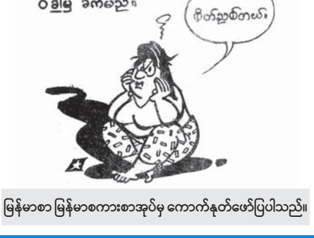
မြန်မာစာ မြန်မာစကားစာအုပ်မှ ကောက်နုတ်ဖော်ပြပါသည်။