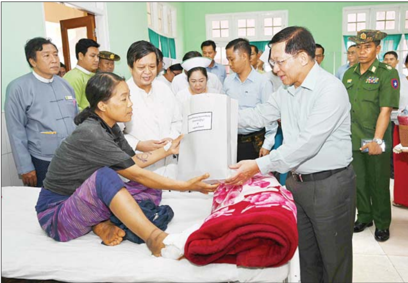
နိုင်ငံတော်စီမံအုပ်ချုပ်ရေးကောင်စီဥက္ကဋ္ဌ နိုင်ငံတော်ဝန်ကြီးချုပ် ဗိုလ်ချုပ်မှူးကြီး မင်းအောင်လှိုင် ပြင်ဦးလွင်မြို့ အထွေထွေ ရောဂါကုပြည်သူ့ဆေးရုံကြီးသို့ တက်ရောက်ဆေးကုသမှုခံယူလျက်ရှိသည့် ဒေသခံပြည်သူများကို ထောက်ပံ့ပစ္စည်းများ ပေးအပ်စဉ်။

ရှင်းလင်းတင်ပြမှုများအပေါ် ကော်မီ သည် စီးပွားရေးအရ ထွက်မြောက်သည့် လုပ်ငန်းတစ်ခုဖြစ်ကြောင်း၊ ကမ္ဘာပေါ် တွင် ကော်ဖီကို အဓိကစိုက်ပျိုးထုတ်လုပ် ပြီး ပြည်ပသို့ တင်ပို့ရောင်းချသည့် နိုင်ငံများလည်းရှိကြောင်း၊ မိမိတို့အနေ ဖြင့် ကော်ဖီစိုက်ပျိုးထုတ်လုပ်မှုများကို တိုးတက်အောင်ဆောင်ရွက်ပြီး ပြည်ပသို့ တင်ပို့နိုင်ရန်လိုကြောင်း၊ ကော်ဖီစိုက်ပျိုး ထုတ်လုပ်မှုကို နိုင်ငံတော်၏ ဝိုက်ပိုက် တစ်ခုအနေဖြင့် ဆောင်ရွက်သွားရန် လိုကြောင်း၊ ကော်ဖီစိုက်ပျိုးမှုများကို စည်းကမ်းနှင့်အညီ ဆောင်ရွက်သွား ရန်လိုကြောင်း၊ ဆေးရုံတည်ဆောက်ရေး အတွက် မြေနေရာရွေးချယ်ရာတွင် အခြေခံလိုအပ်ချက်များဖြစ်သည့် ရေ၊ မီးဖျားရရှိရေး၊ အုပ်ချုပ်မှုကိစ္စရပ်များ ဆောင်ရွက်ရန် အလှမ်းမီသည့်နေရာ ဖြစ်စေရေးနှင့် လမ်းပန်းဆက်သွယ်မှု ကောင်းမွန်သည့်နေရာ ဖြစ်စေရေးတို့ကို အခြေခံ၍ ရွေးချယ်ဆောင်ရွက်သွားရန် လိုကြောင်း၊ စည်ပင်သာယာရေး တာဝန် ရှိသူများအနေဖြင့် လမ်းပန်းစနစ်တကျ ဖြစ်စေရန်နှင့် လမ်းပန်းကောင်းမွန်အောင် ဆောင်ရွက်ရန်လိုပြီး လမ်းအင်္ဂါရပ်များ နှင့် ကိုက်ညီအောင် ဖောက်လုပ်