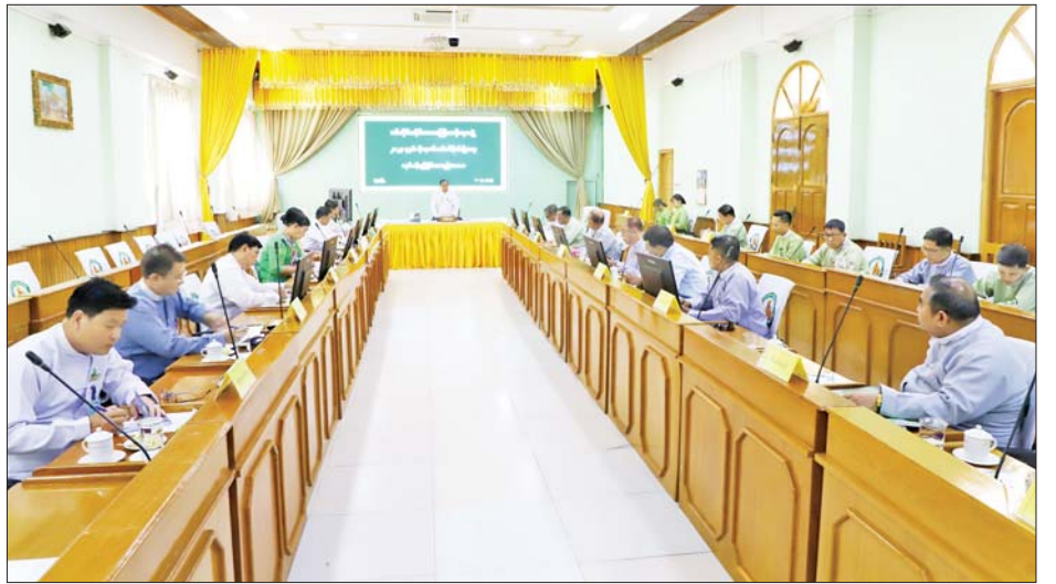
အနေများနှင့်ပတ်သက်၍ ဆွေးနွေးတင်ပြကြရာ တာဝန်ရှိသူများနှင့် ဖြည့်ဆည်းပေါင်းစပ်ဆောင်ရွက် တိုင်းဒေသကြီးဝန်ကြီးချုပ်က လိုအပ်သည်များကို ပေးခဲ့ကြောင်း သိရသည်။ တိုင်းဒေသကြီး(ပြန်/ဆက်)

ယင်းနောက် တိုင်းဒေသကြီး အစိုးရအဖွဲ့ဝင်များနှင့် အစည်းအဝေးသို့ တက်ရောက်လာသူများက တိုင်းဒေသကြီးအတွင်းရှိ မြို့နယ်များတွင် ၂၀၂၄ ခုနှစ် မိုးရာသီသစ်ပင်စိုက်ပျိုးရေး လုပ်ငန်းအခြေ