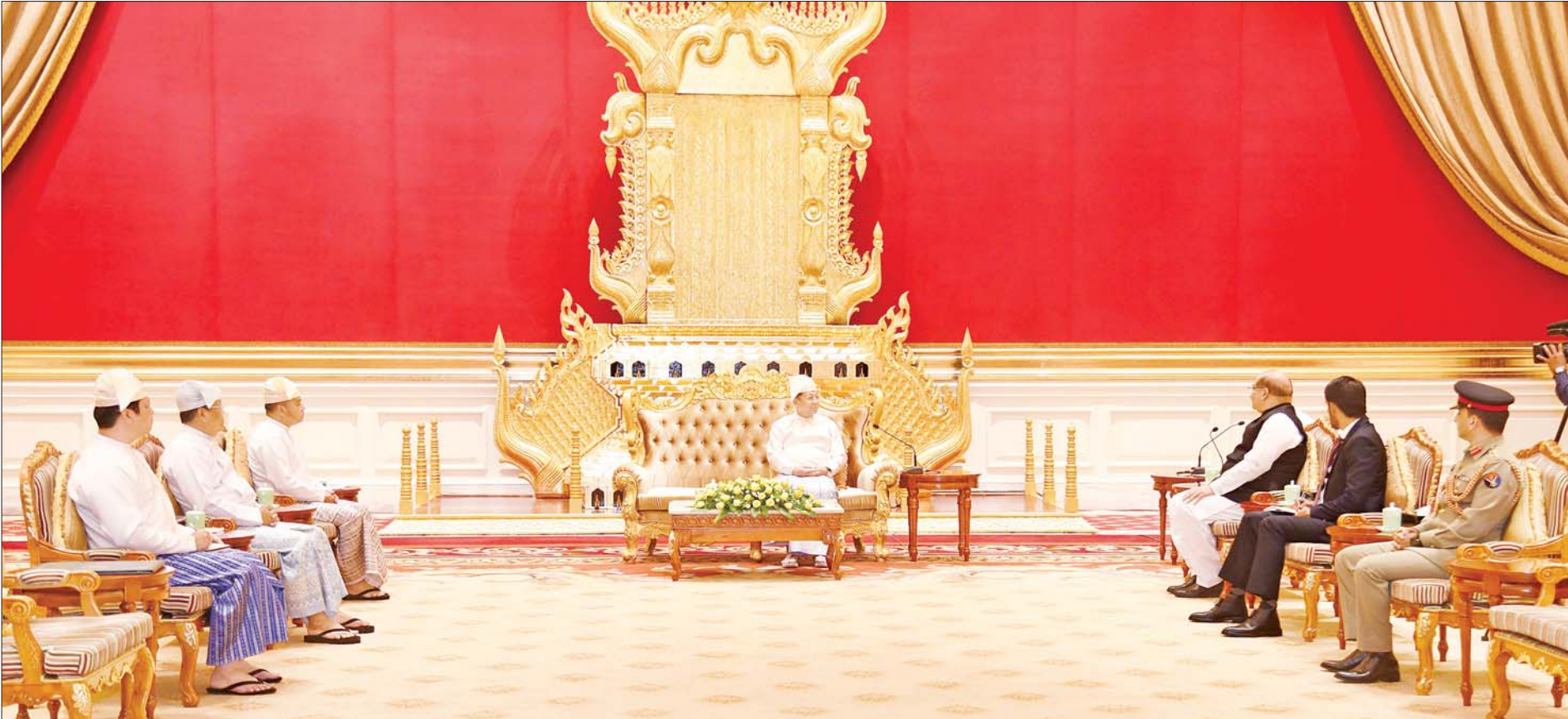
နိုင်ငံတော်စီမံအုပ်ချုပ်ရေးကောင်စီဥက္ကဋ္ဌ နိုင်ငံတော်ဝန်ကြီးချုပ် ဗိုလ်ချုပ်မှူးကြီးမင်းအောင်လှိုင် မြန်မာနိုင်ငံဆိုင်ရာ ပါကစ္စတန်နိုင်ငံသံအမတ်ကြီး H.E. Mr. Imran Haider အား လက်ခံတွေ့ဆုံစဉ်။