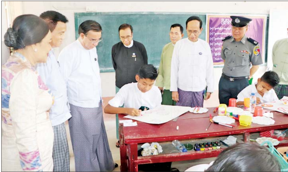
နေမှုများကို လှည့်လည်ကြည့်ရှုအားပေးကြသည်။ ပဲခူးတိုင်းဒေသကြီးအတွင်း ပန်းချီ၊ ကာတွန်း၊ ပုံစတာနှင့် ကွန်ပျူတာပန်းချီတို့ကို သတ်မှတ်ပြိုင်ပွဲဝင်ခေါင်းစဉ်များဖြင့် သက်ဆိုင်ရာ အခြေခံပညာကျောင်းများ၌ စုစုပေါင်း ကျောင်းသား ကျောင်းသူ ၈၃၁ ဦး ဝင်ရောက်ယှဉ်ပြိုင်လျက်ရှိကြောင်း သိရသည်။ ဆက်လက်၍ တိုင်းဒေသကြီးဝန်ကြီးချုပ်နှင့်

ဦးစွာ တိုင်းဒေသကြီးဝန်ကြီးချုပ် ဦးမျိုးဆွေဝင်းသည် ပဲခူးမြို့ အမှတ်(၁)အခြေခံပညာအထက်တန်းကျောင်း၌ ပဲခူးတိုင်းဒေသကြီး မူးယစ်ဆေးဝါးနှင့်စိတ်ကိုပြောင်းလဲစေသော ဆေးဝါးများအန္တရာယ်တားဆီးကာကွယ်ရေးအဖွဲ့က ကြီးမှူးကျင်းပသည့် ပဲခူးမြို့နယ်အတွင်းရှိ အခြေခံပညာအထက်တန်း၊ အလယ်တန်း၊ မူလတန်းအဆင့် ကျောင်းသားကျောင်းသူများက အပြည်ပြည်ဆိုင်ရာ မူးယစ်ဆေးဝါးအလွဲသုံးမှုနှင့် တရားမဝင်ရောင်းဝယ်မှုတိုက်ဖျက်ရေးနေ့အထိမ်းအမှတ် ပန်းချီ၊ ကာတွန်း၊ ပုံစတာနှင့် ကွန်ပျူတာပန်းချီ ဝင်ရောက်ယှဉ်ပြိုင်