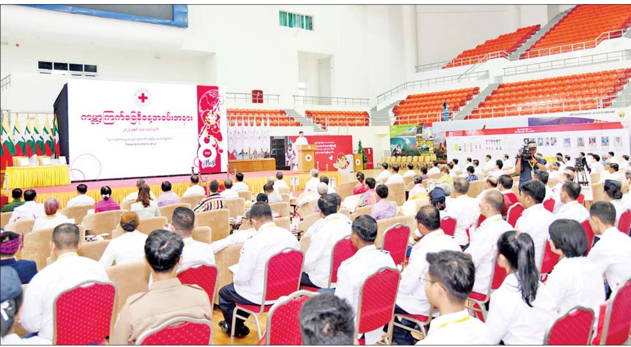
နိုင်ငံတော်စီမံအုပ်ချုပ်ရေးကောင်စီဝင် ဒုတိယဝန်ကြီးချုပ်နှင့် ပြည်ထောင်စုဝန်ကြီး ဗိုလ်ချုပ်ကြီးမြထွန်းဦး ၂၀၂၄ ခုနှစ် ကမ္ဘာ့ကြက်ခြေနီနေ့ အထိမ်းအမှတ်အခမ်းအနားတွင် ဂုဏ်ပြုအမှာစကားပြောကြားစဉ်။

နေပြည်တော် မေ ၈ ၂၀၂၄ ခုနှစ် ကမ္ဘာ့ကြက်ခြေနီနေ့ အထိမ်းအမှတ် အခမ်းအနားကို ယနေ့နံနက်ပိုင်းတွင် နေပြည်တော် ရှိ ဝဏ္ဏသိဒ္ဓိအားကစားကွင်း(ဘီ)ရှိ ဌာနအမှတ် ၁၈၅၉ ခုနှစ် ဆိုဗာရီနီစစ်မြေပြင်က အစပြု၍ လူသားများ၏ လူမှုကရုဏာ လိုအပ်ချက်များကို ဆောင်ရွက် ပေးနေခဲ့သည့် ကြက်ခြေနီတပ်ဖွဲ့မှ သက်တမ်း သည် ရာစုနှစ်တစ်ခုကျော် တည်ရှိ ခဲ့ပြီးဖြစ်ကြောင်း၊ ယခုဆိုလျှင် နိုင်ငံပေါင်း ၁၉၁ နိုင်ငံတွင် နိုင်ငံ အစိုးရများက ဖွဲ့စည်းထားသည့် အမျိုးသားကြက်ခြေနီ/လခြမ်းနီ အသင်းပေါင်း ၁၉၁ သင်းမှ ကြက်ခြေနီစေတနာလုပ်အားရှင် များသည် အကူအညီလိုအပ်သူ များကို လူမှုကရုဏာ အကူအညီ များ ပေးနိုင်နေကြပြီဖြစ်ကြောင်း၊ မြန်မာနိုင်ငံတွင်လည်း မြန်မာ နိုင်ငံ ကြက်ခြေနီအသင်းအနေဖြင့် နိုင်ငံအတွင်း လူသားချင်းစာနာ ထောက်ထားမှုအကူအညီများကို ကြက်ခြေနီအခြေခံမူများနှင့်အညီ ကူညီဆောင်ရွက်ပေးနေသည်ကို သိရှိရသည့်အတွက် ဂုဏ်ယူပါ ကြောင်း။ နိုင်ငံတော်က လက်မှတ်ရေးထိုး ထားသည့် ဂျီနီဗာသဘောတူညီချက်များ (Geneva Conventions) နှင့် အပြည်ပြည်ဆိုင်ရာ ကြက်ခြေနီ/လခြမ်းနီ လှုပ်ရှားမှုများ၏ ဥပဒေသများအရ မြန်မာနိုင်ငံ ကြက်ခြေနီအသင်းကို နိုင်ငံအတွင်း လူသားချင်း စာနာထောက်ထား မှုလုပ်ငန်းများ လွတ်လပ်စွာ ဆောင်ရွက်ခွင့် ပေးထားပြီးဖြစ် သည့်အတွက် ကြက်ခြေနီအခြေခံ