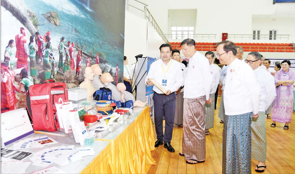
နိုင်ငံတော်စီမံအုပ်ချုပ်ရေးကောင်စီဝင် ဒုတိယဝန်ကြီးချုပ်နှင့် ပြည်ထောင်စုဝန်ကြီး ဗိုလ်ချုပ်ကြီးမြထွန်းဦးနှင့် အခမ်းအနားတက်ရောက်လာကြသူများ ကမ္ဘာ့ကြက်ခြေနီနေ့အထိမ်းအမှတ်ပြခန်းများကို ကြည့်ရှုကြစဉ်။

❖ တိုင်းဒေသကြီး/ ပြည်နယ်၊ ခရိုင်၊ မြို့နယ် ပြန်/ဆက် ဦးစီးဌာနရုံးများ ပြန်ကြားရေးဝန်ကြီးဌာန