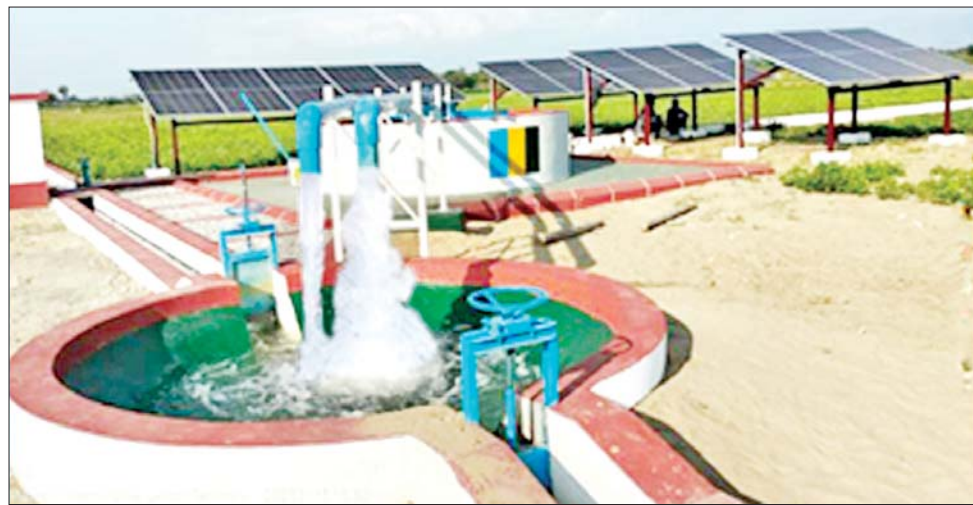
တပ်ကုန်းမြို့နယ် နွယ်ရစ်ကျေးရွာ စက်ရေတွင်း။

ထိုသို့ စိုက်ပျိုးထုတ်လုပ်မှုတိုးတက်လာမှုနှင့်အတူ ဒေသခံတောင်သူများ၏ လူမှုစီးပွားဘဝများ ပိုမိုတိုးတက်လာမည်ဖြစ်ပြီး နိုင်ငံ၏စီးပွားရေးတိုးတက်ဖွံ့ဖြိုးမှုတွင်လည်း များစွာအထောက်အကူပြုလာစေမည်ဖြစ်ကြောင်း ရေးသားလိုက်ရပါသည်။ ။