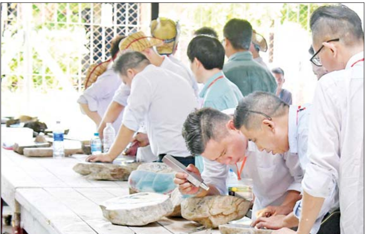
ကျွန်ုပ်တို့နေသည့် ကျောက်စိမ်းအတွဲများကို ရောင်းချပေးသွားမည် ဖြစ်ကြောင်း သိရ အိတ်ဖွင့်တင်ဒါစနစ်ဖြင့် ဆက်လက် သတင်းစဉ်

အတွင်း၌ ကျောက်မျက်ရတနာနှင့် လက်ဝတ် ရတနာအရောင်းဆိုင်များကိုလည်း ဖွင့်လှစ် ထားရှိရာ လာရောက်လေ့လာ ဝယ်ယူသူ များဖြင့်လည်း စည်ကားလျက်ရှိသည်။ (၅၉)ကြိမ်မြောက် မြန်မာ့ကျောက်မျက်ရတနာပြပွဲကို နေပြည်တော်ရှိ မဏိ ရတနာ ကျောက်စိမ်းခန်းမ၌ မေ ၃ ရက် မှ ၁၂ ရက်အထိ ကျင်းပနေခြင်းဖြစ်ပြီး ပြပွဲဒုတိယနေ့တွင် ပုလဲအတွဲပေါင်း ၁၈၂ တွဲ၊ တတိယနေ့တွင် ပုလဲအတွဲပေါင်း ၁၉၇ တွဲ၊ စတုတ္ထနေ့တွင် ကျောက်မျက် အတွဲပေါင်း ၈၈ တွဲ၊ ပဉ္စမနေ့တွင် ကျောက်စိမ်းအတွဲပေါင်း ၅၄၆ တွဲနှင့် ဆဋ္ဌမနေ့တွင် ကျောက်စိမ်းအတွဲပေါင်း ၅၆၉ တွဲတို့ကို ရောင်းချပေးနိုင်ခဲ့ပြီး