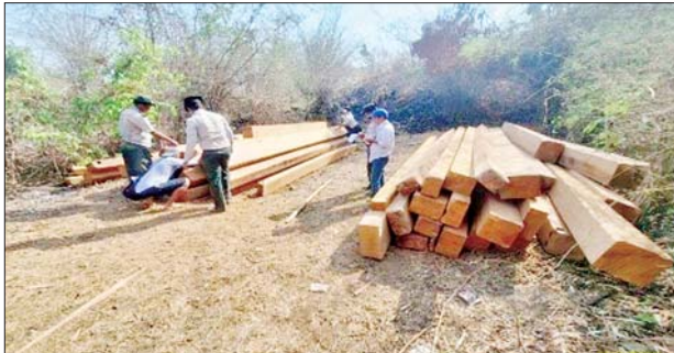
ဒဿမ ၁၉၇၆ တန် စုစုပေါင်း ၂၂၇ ရမိခဲ့ကြောင်း သစ်တောဦးစီး ဒဿမ ၂၃၉၈ တန်၊ ယာဉ်/ ယန္တရား ၅၃၄၅ တန်၊ သစ်မာ ၁၇ သုံးစီး၊ တရားခံ ရှစ်ဦး ဖမ်းဆီး သတင်းစဉ်

အထည်ဖော် ဆောင်ရွက်လျက် ရှိရာ ဧပြီ ၂၉ ရက်မှ မေ ၅ ရက် အထိ နေပြည်တော်၊ ပြည်နယ်နှင့် တိုင်းဒေသကြီး သစ်တောဦးစီး ဌာနများမှ ပေးပို့လာသော စာရင်း များအရ တရားမဝင်ကျွန်း ၁၉ ဒဿမ ၀၄၃၈ တန်၊ သစ်မာ ၁၇ ဒဿမ ၇၉၈၄ တန်၊ အခြား ၁၉၀