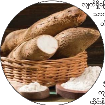
ဂျုံမှုန့်အစား ပီလောပီနံ့အမှုန့်များ အစားထိုး၍ အသုံးပြုလာသောကြောင့် ပြည်တွင်းဝယ်ယူအား မြင့်တက်လျက်ရှိကြောင်း သိရသည်။

နေပြည်တော် မေ ၈ မွန်ပြည်နယ်အတွင်းရှိ မြို့နယ်၊ ကျေးရွာများတွင် စိုက်ပျိုးရန်လွယ်ကူပြီး လုပ်အားခန့် ကုန်ကျစရိတ်သက်သာ သော ပီလောပီနံ့များကို နေရာအနှံ့စိုက်ပျိုးလျက်ရှိပြီး အချို့ကျေးရွာများတွင် အိမ်ခြံစည်းရိုးများတွင်ပင် စိုက်ပျိုး လျက်ရှိကြောင်း၊ ပီလောပီနံ့မှုန့်များကို စားသောက်ကုန်များဖြစ်သည့် ကော်မှုန့်၊ သာကူချောင်း၊ သာကူစေ့များပြုလုပ်ခြင်း၊ ဂျုံမှုန့်နှင့်ရောနှော၍ အသုံးပြုခြင်း၊ တိရစ္ဆာန်အစာတောင့်များအဖြစ် ပြုလုပ်ခြင်းတို့တွင် အသုံးပြုလျက်ရှိ ကြောင်း သိရသည်။ ဝဥစက်ရုံများအနေဖြင့် ဇန်နဝါရီလနောက်ပိုင်း ဝဥရာသီကုန်ဆုံး ချိန်တွင် လုပ်ငန်းလည်ပတ်မှုရပ်ဆိုင်းခြင်း မဖြစ်စေရန် ပီလောပီနံ့များ ဆက်လက်ထုတ်လုပ်လျက်ရှိကြောင်း သိရသည်။ ဈေးနှုန်းအနေဖြင့် ပီလောပီနံ့ (အစုံ) တစ်ပိဿာလျှင် စက်ရုံအရောက်ဈေးနှုန်း ကျပ် ၅၀၀-၁၀၀၀ ဖြင့် ဝယ်ယူရရှိပြီး အမှုန့်ကြိတ်ကာ အမှုန့်တစ်ပိဿာလျှင် ကျပ် ၃၀၀၀ ဖြင့် ရောင်းချကြောင်း၊ ယခင်နှစ်တွင် ပီလောပီနံ့အမှုန့်များကို ထိုင်းနိုင်ငံသို့ တင်ပို့ရောင်းချခဲ့သော်လည်း ယခုနှစ်တွင် ပြည်ပမှတင်သွင်းသည့် ပီလောပီနံ့အမှုန့်များ အစားထိုး၍ အသုံးပြုလာသောကြောင့် ပြည်တွင်းဝယ်ယူအား မြင့်တက်လျက်ရှိကြောင်း သိရသည်။