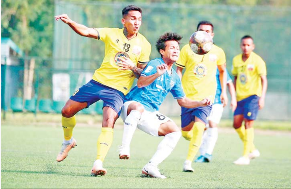
ရခိုင်ယူနိုက်တက်အသင်းနှင့် ကချင်ယူနိုက်တက်အသင်းတို့ ယှဉ်ပြိုင်ကစားကြစဉ်။

ရန်ကုန် မေ ၈ ၂၀၂၄ MNL Cup ပြိုင်ပွဲ အုပ်စု (ခ) ပွဲစဉ်(၈)ကို မေ ၈ ရက်က ဆက်လက်ကျင်းပရာ ရခိုင်ယူနိုက်တက်အသင်းနှင့် Glory Goal အသင်း နိုင်ပွဲရခဲ့သည်။ YUSC ကွင်း၌ ကျင်းပသည့်ပွဲတွင် ရခိုင်ယူနိုက်တက်အသင်းက ကချင် ယူနိုက်တက်အသင်းကို ငါးဂိုးပြတ် အနိုင်ရခဲ့သည်။ ရခိုင်ယူနိုက်တက်အသင်းသည် ဆီမီးဖိုင်နယ်တက်ရောက်ရေး မျှော်လင့်ချက်အတွက် ဂိုးပြတ်နိုင်ပွဲရယူပြီး အုပ်စုထိပ်ဆုံးတွင် ဦးဆောင်နေသည့် ရှမ်းယူနိုက်တက်ကို ရမှတ်တူဖြင့် ဆက်လက်ဖိအားပေးခဲ့သည်။ စာမျက်နှာ ၁၆ ကော်လံ ၅ သို့ ၆