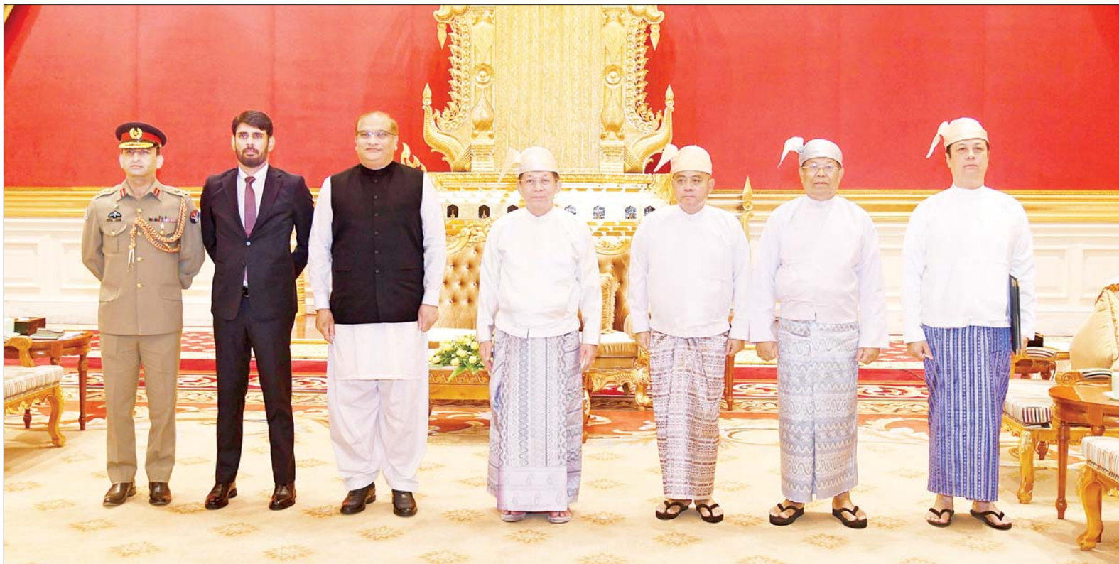
နိုင်ငံတော်စီမံအုပ်ချုပ်ရေးကောင်စီဥက္ကဋ္ဌ နိုင်ငံတော်ဝန်ကြီးချုပ် ဗိုလ်ချုပ်မှူးကြီးမင်းအောင်လှိုင် ဦးဆောင်သော အဖွဲ့နှင့် မြန်မာနိုင်ငံဆိုင်ရာ ပါကစ္စတန်နိုင်ငံ သံအမတ်ကြီး H.E. Mr. Imran Haider ဦးဆောင်သောအဖွဲ့တို့ စုပေါင်းမှတ်တမ်းတင် ဓာတ်ပုံရိုက်စဉ်။

မိုးတိမ်တောင်ဖြစ်ပေါ်မှု အခြေအနေ နေပြည်တော် မေ ၈ နေပြည်တော်၊ မန္တလေးတိုင်းဒေသကြီး၊ မကွေးတိုင်းဒေသကြီး၊ ပဲခူးတိုင်းဒေသကြီး၊ ရန်ကုန်တိုင်းဒေသကြီး၊ ဧရာဝတီတိုင်းဒေသကြီး၊ တနင်္သာရီတိုင်းဒေသကြီး၊ ရှမ်းပြည်နယ်၊ ရခိုင်ပြည်နယ်၊ ကယားပြည်နယ်၊ ကရင်ပြည်နယ်နှင့် မွန်ပြည်နယ်တို့တွင် မိုးတိမ်တောင်များ ဖြစ်ထွန်းလျက်ရှိပြီး အဆိုပါမိုးတိမ်တောင်များ ရွေ့လျားရာ နေရာတစ်လျှောက်တွင် မိုးရွာသွန်းခြင်းနှင့်အတူ လေပြင်းတိုက်ခတ်ခြင်း၊ မိုးထစ်ချွန်းခြင်း၊ မိုးကြိုးပစ်ခြင်း၊ လျှပ်စီးလက်ခြင်းနှင့် မိုးသီးကြွေခြင်း စသည့်မိုးလေဝသဖြစ်စဉ်များ ဖြစ်ပေါ်နိုင်ပါသဖြင့် ကြိုတင်သတိပြုနိုင်ပါရန် အကြံပြုအပ်ပါသည်။ မိုး/လေ