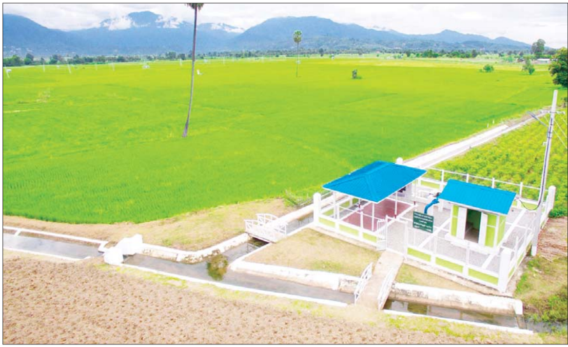
တပ်ကုန်းမြို့နယ် ရှောက်ကုန်းကျေးရွာ စက်ရေတွင်း။

မြေအောက်ရေဖြင့် ဖြည့်စွက်စိုက်ပျိုးရေးပေးဝေ နေပြည်တော်ကောင်စီနယ်မြေသည် နိုင်ငံတော်၏ မြို့တော်ဖြစ်သည်နှင့်အညီ Green , Clean & Smart City အဖြစ် တိုးတက်အောင် အဓိကထားဆောင်ရွက်လျက်ရှိသကဲ့သို့ အခြား တိုင်းဒေသကြီးနှင့် ပြည်နယ်များ၏ စံပြုနယ်မြေတစ်ခု ဖြစ်စေရေး ဆောင်ရွက်ရာတွင် အထောက်အကူပြုစေရန် ရည်ရွယ်ကာ တပ်ကုန်းမြို့နယ်အနီး ရန်ကုန်-မန္တလေး လမ်းဟောင်း ကားလမ်းမကြီးဘေးဘက် ဝဲ/ယာရှိ ဆင်သေချောင်းနှင့် နဝင်းချောင်းတို့ ပေါင်းဆုံရာ မြေနုလွင်ပြင်ပေါ်ရှိ ရှောက်ကုန်း၊ ကျားသေအိုင်၊ နွယ်ရစ်ကျေးရွာ အနီးဝန်းကျင်တွင် မြေအောက်ရေဖြင့် ဖြည့်စွက်စိုက်ပျိုးရေး ပေးဝေခြင်းစီမံကိန်းကို ဆည်မြောင်းနှင့် ရေအသုံးချမှု စီမံခန့်ခွဲရေးဦးစီးဌာနက အကောင်အထည်ဖော် ဆောင်ရွက်လျက်ရှိသည်။