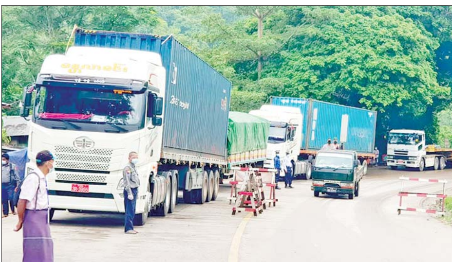
လမ်းဟောင်းကို အသုံးပြု၍ သွားလာနေသော မြဝတီကုန်စည်ပို့ဆောင်ရေးကားများကို တွေ့ရစဉ်။

ရန်ကုန် မေ ၈ မြဝတီမြို့တွင် ချစ်ကြည်ရေး တံတားနှစ်စင်း ပြန်လည်ဖွင့်လှစ် ပြီးနောက် ပုံမှန်အတိုင်း ကုန်သွယ်၊ သွားလာမှုများ စည်ကားအသက် ဝင်နေပြီဖြစ်ကြောင်း ကုန်သည် များနှင့် ဒေသခံများထံ ဆက်သွယ် မေးမြန်းထားသည့် အချက် အလက်များအရ သိရသည်။ မြဝတီမြို့နှင့် ထိုင်းနိုင်ငံကို ဆက်သွယ်ထားသော မြန်မာ - ထိုင်းချစ်ကြည်ရေးတံတား အမှတ် (၁) ကို ဧပြီ ၂၁ ရက်တွင် ယာယီ ပိတ်ပြီးနောက် ဧပြီ ၂၇ ရက်တွင် ပြန်လည်ဖွင့်လှစ်ခဲ့ခြင်း ဖြစ်ကာ ချစ်ကြည်ရေး တံတားအမှတ် (၂) ကို ဧပြီ ၁၁ ရက်တွင် ယာယီ ပိတ်ပြီးနောက် ဧပြီ ၂၀ ရက်တွင် ပြန်လည်ဖွင့်လှစ်ခဲ့သည်။ “လက်ရှိ အနေအထားအရ အမှတ်(၂) တံတားက ပုံမှန်အတိုင်း ပြန်လည်ဖွင့်လှစ်ပြီး ကုန်စည် စီးဆင်းမှုအတွက် ထိုင်း-မြန်မာ နယ်စပ်ကုန်သွယ်ရေး ဇန်ထက် ထိုင်းဘက်မှ ကုန်စည်တွေ မြန်မာ ပြည်ထဲဝင်သလို မြန်မာပြည် ထဲမှ ကုန်စည်တွေလည်း ထိုင်း ဘက်ဆီဝင်နေတဲ့ အနေအထား