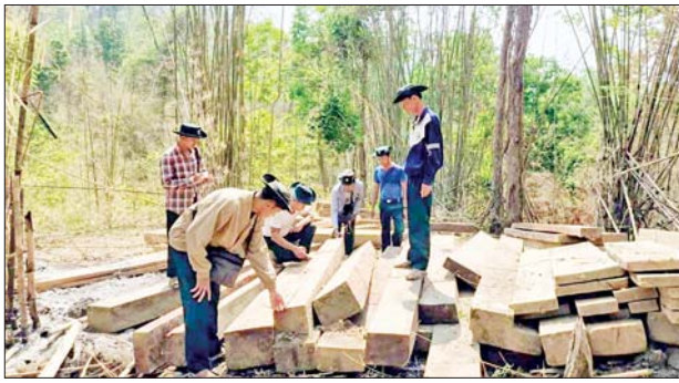
ပဲခူးတိုင်းဒေသကြီး၌ သိမ်းဆည်းရမိမှုမှတ်တမ်းဓာတ်ပုံ။

ထို့အတူ မေ ၆ ရက်တွင် မန္တလေးတိုင်းဒေသကြီးတရားမဝင် ကုန်သွယ်မှုတိုက်ဖျက်ရေးအဖွဲ့၏ စီမံခန့်ခွဲမှုဖြင့် တာဝန်ကျ ပူးပေါင်းအဖွဲ့က စစ်ဆေးမှုများ ဆောင်ရွက်ခဲ့ရာ ရန်ကုန်-မန္တလေး လမ်းဟောင်း ဟန်မြင့်မိုရ်ရွာအနီး၌ ရပ်တန့်ထားသော ယာဉ်ခန့်စစ်စီး ပေါ်မှ တရားဝင်စာရွက်စာတမ်းအထောက်အထား တင်ပြနိုင်ခြင်းမရှိ သည့် တရုတ်နိုင်ငံထုတ် ကြက်သွန်ဖြူ ၂၀ ကီလိုဂရမ်ပါအိတ် ၄၇၅၀ (ခန့်မှန်းတန်ဖိုးငွေကျပ် ၁၉၀၀၀၀၀၀)နှင့် အဆိုပါပစ္စည်းများ တင်ဆောင်လာသည့် Hino Profia Truck တစ်စီး၊ Mitsubishi Fuso Truck သုံးစီး၊ Nissan Diesel Truck သုံးစီး (ခန့်မှန်းတန်ဖိုးငွေကျပ်