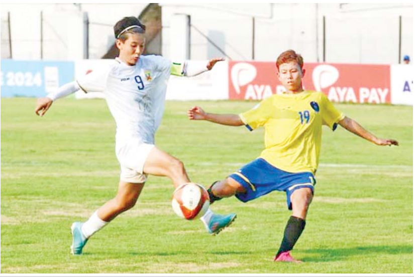
ရှမ်းယူနိုက်တက်အသင်းနှင့် အား/ကာသိပွဲအသင်းတို့ ယှဉ်ပြိုင်ကစားကြစဉ်။