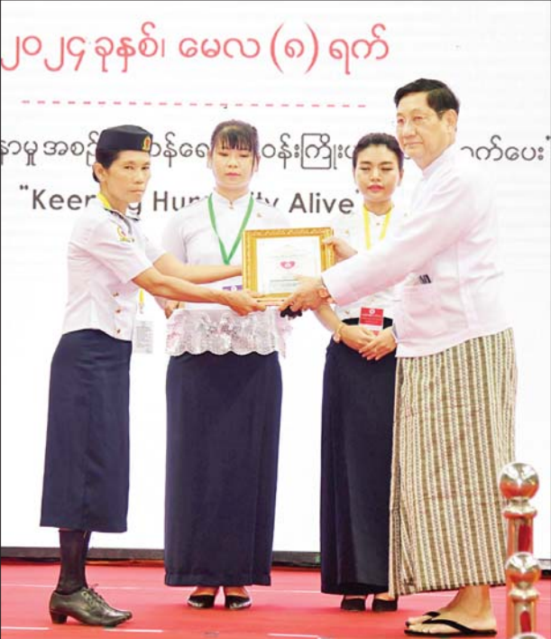
နိုင်ငံတော်စီမံအုပ်ချုပ်ရေးကောင်စီအဖွဲ့ဝင် ဒေါက်တာဘရွှေ ၂၀၂၄ ခုနှစ် ကမ္ဘာ့ကြက်ခြေနီနေ့အထိမ်းအမှတ် ကဗျာပြိုင်ပွဲတွင် မြန်မာဘာသာဖြင့် ဆုရရှိသူတစ်ဦးအား ဂုဏ်ပြုဆုတံဆိပ်၊ ဂုဏ်ပြု မှတ်တမ်းလွှာနှင့် ဂုဏ်ပြုဆုငွေများ ပေးအပ်ချီးမြှင့်စဉ်။