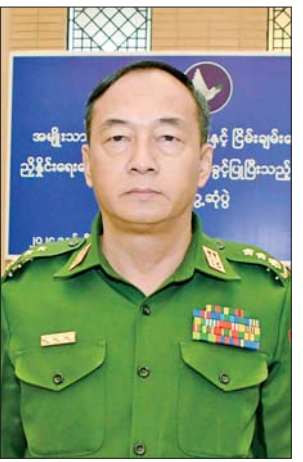
ဗိုလ်မှူးကြီးဝဏ္ဏအောင်

ဒေါက်တာအောင်မြတ်ဦး ဗဟိုကော်မတီဝင်၊ ပြည်ထောင်စု ကြံ့ခိုင်ရေးနှင့်ဖွံ့ဖြိုးရေးပါတီ အခုလို နိုင်ငံရေးပါတီတွေနဲ့ တွေ့ဆုံဆွေးနွေးပွဲတွေ၊ NSPC က ဆောင်ရွက်ပေးတဲ့ ဆွေးနွေးပွဲတွေ၊ အခြားနိုင်ငံတွေရဲ့ ဖွဲ့စည်းပုံအခြေခံ ဥပဒေနဲ့ ဖက်ဒရယ်စနစ်ဆိုင်ရာ တွေကို သွားရောက်လေ့လာရ တာတွေက ကျွန်တော်တို့အတွက် အများကြီး အထောက်အကူဖြစ်ပါ တယ်။ ဒီမိုကရေစီနဲ့ ဖက်ဒရယ် စနစ်ကို သွားမယ်ဆိုရင် ကျွန်တော် တို့ မသိတာတွေ များများသိလာဖို့ လိုပါတယ်။ ကျွန်တော်တို့ရဲ့ အတွေး တွေ ပိုပြီးမြင့်လာဖို့လိုပါတယ်။ ဒီလိုအကျိုးကျေးဇူးတွေ အများကြီး ရပါတယ်။ ဒါကြောင့် ဒီလိုတွေ့ဆုံ ဆွေးနွေးပွဲတွေကို ကြိုဆိုပါတယ်။ တည်ငြိမ်အေးချမ်းမှုက ရပ်ကွက် တစ်ခုပဲဖြစ်ဖြစ်၊ ဒေသတစ်ခုပဲ ဖြစ်ဖြစ်၊ နိုင်ငံတစ်ခုပဲဖြစ်ဖြစ်မဖြစ် မနေလိုအပ်ပါတယ်။ တည်ငြိမ်မှုမရှိ ရင် ကျန်းမာရေး၊ စီးပွားရေး၊ ပညာ ရေးအကုန်ခက်ခဲပါတယ်။ တည်ငြိမ် အေးချမ်းမှုမရှိရင် ဖွံ့ဖြိုးတိုးတက် ရေးကလည်း လုပ်ဆောင်လို့မရပါ ဘူး။ ဒါကြောင့် အဘက်ဘက်က ဝိုင်းဝန်းစဉ်းစားကြပြီး တိုင်းပြည် တည်ငြိမ်အေးချမ်းရေးကို ဝိုင်းဝန်း လုပ်ဆောင်ကြဖို့ လိုပါတယ်။