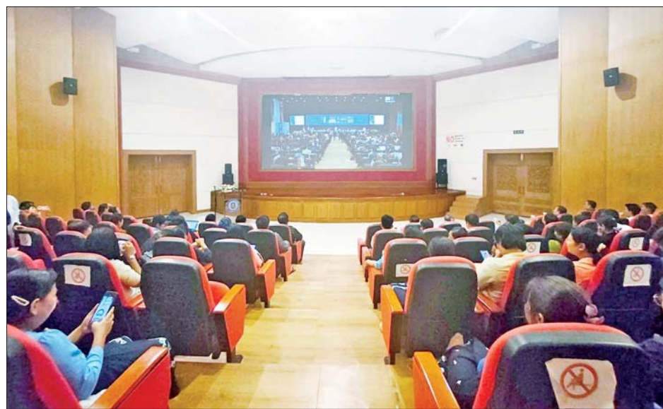
ပါဝင်သောအဆိုပြုစာတွဲ (Nomination File)ကို UNESCO ဒြပ်မဲ့ယဉ်ကျေးမှုအမွေအနှစ်ကော်မတီ (Committee of Intangible Cultural Heritage) သို့ ပေးပို့တင်သွင်းခဲ့သည်။ တင်သွင်းသည့်လုပ်ငန်း စဉ်ကို ဆောင်ရွက်ရာတွင် နိုင်ငံတော်အစိုးရ၏ ပံ့ပိုး ကူညီမှုများ၊ သာသနာရေးနှင့် ယဉ်ကျေးမှုဝန်ကြီးဌာန ၏ စုစည်းဆောင်ရွက်မှုများ၊ မြန်မာ့ယဉ်ကျေးမှုအမွေ အနှစ် ထိန်းသိမ်းစောင့်ရှောက်ရေးအဖွဲ့ဥက္ကဋ္ဌနှင့် အဖွဲ့ဝင်များ၊ တိုင်းဒေသကြီး/ ပြည်နယ်အသီးသီးရှိ လူမှုအဖွဲ့အစည်း (NGO)များ၊ တိုင်းရင်းသားမျိုးနွယ် စုများ၊ မိဒီယာနှင့် ဆိုရှယ်မီဒီယာသုံးစွဲသူများ၊ မြန်မာ့ ရိုးရာအမွေအနှစ်ကို အမြတ်တနိုးတန်ဖိုးထားသည့်

နေပြည်တော် ဒီဇင်ဘာ ၅ ပါရာဂျေးနိုင်ငံ အာဆွန်စီယွန်မြို့၌ ၂၀၂၄ ခုနှစ် ဒီဇင်ဘာ ၂ ရက်မှ ၇ ရက်အထိ ကျင်းပသည့် (၁၉) ကြိမ်မြောက် ဒြပ်မဲ့ယဉ်ကျေးမှုအမွေအနှစ်ညီလာခံ တွင် မြန်မာနိုင်ငံ သာသနာရေးနှင့် ယဉ်ကျေးမှု ဝန်ကြီးဌာနမှ အဆိုပြုတင်သွင်းထားသည့် “မြန်မာ့ ရိုးရာနှစ်သစ်ကူးအတာသင်္ကြန်ပွဲတော်” စာတွဲအား ယူနက်စကို၏ လူသားမျိုးနွယ်ဆိုင်ရာ ဒြပ်မဲ့ယဉ်ကျေး မှုအမွေအနှစ်စာရင်း (Representative List of the Intangible Cultural Heritage of Humanity)တွင် ပါဝင်နိုင်ရေး တရားဝင်ဆုံးဖြတ်ခဲ့ပြီးဖြစ်ရာ ယခုဆို လျှင် မြန်မာနိုင်ငံမှ တင်သွင်းထားသည့် “မြန်မာ့ရိုးရာ နှစ်သစ်ကူးအတာသင်္ကြန်ပွဲတော်” သည် ကမ္ဘာ့ ဒြပ်မဲ့ယဉ်ကျေးမှုအမွေအနှစ်စာရင်းတွင် မြန်မာနိုင်ငံ အနေဖြင့် ပထမဆုံးတရားဝင် ပါဝင်နိုင်ခဲ့ပြီဖြစ်သည်။ ထိုကဲ့သို့ ပါဝင်နိုင်ရန်အတွက် ၂၀၂၃ ခုနှစ် မတ် ၂၄ ရက်တွင် မြန်မာ့ရိုးရာနှစ်သစ်ကူးအတာသင်္ကြန် ပွဲတော်နှင့်ပတ်သက်သော အချက်အလက်များ၊ မြန်မာပြည်သူလူထု၏ ပြောကြားချက်များ (Com- munities' Statement)၊ အတာသင်္ကြန်ဆင်နွှဲမှု ရိုးရာဓလေ့ဆိုင်ရာ ရုပ်သံမှတ်တမ်းဗီဒီယိုဖိုင်များ