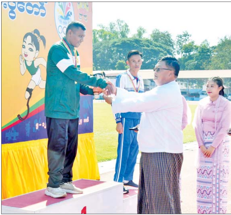
နိုင်ငံတော်စီမံအုပ်ချုပ်ရေးကောင်စီအဖွဲ့ဝင် ဦးရန်ကျော် အမျိုးသား မိတာ ၂၀၀ T 64 အပြေးပြိုင်ပွဲတွင် ပထမဆုရရှိသည့် မွန်ပြည်နယ်မှ ပြိုင်ပွဲဝင်တစ်ဦးအား ဂုဏ်ပြုဆုတံဆိပ်နှင့် အမျိုးသားအားကစားပွဲတော်အထိမ်းအမှတ်အရုပ် ပေးအပ်ချီးမြှင့်စဉ်။

ယင်းနောက် နိုင်ငံတော်စီမံအုပ်ချုပ်ရေးကောင်စီအဖွဲ့ဝင် ဦးရန်ကျော်က အမျိုးသားသံလုံးပစ် F 56/57 ပြိုင်ပွဲတွင် ပထမဆုရရှိသည့် ဧရာဝတီတိုင်းဒေသကြီး၊ ဒုတိယဆုရရှိသည့် မွန်ပြည်နယ်နှင့် တတိယဆုရရှိသည့် ရန်ကုန်တိုင်းဒေသကြီးတို့မှ ပြိုင်ပွဲဝင်များအားလည်းကောင်း၊ အမျိုးသား မိတာ ၂၀၀ T 64 အပြေးပြိုင်ပွဲတွင် ပထမဆုရရှိသည့် မွန်ပြည်နယ်၊ ဒုတိယဆုရရှိသည့် မန္တလေးတိုင်းဒေသ