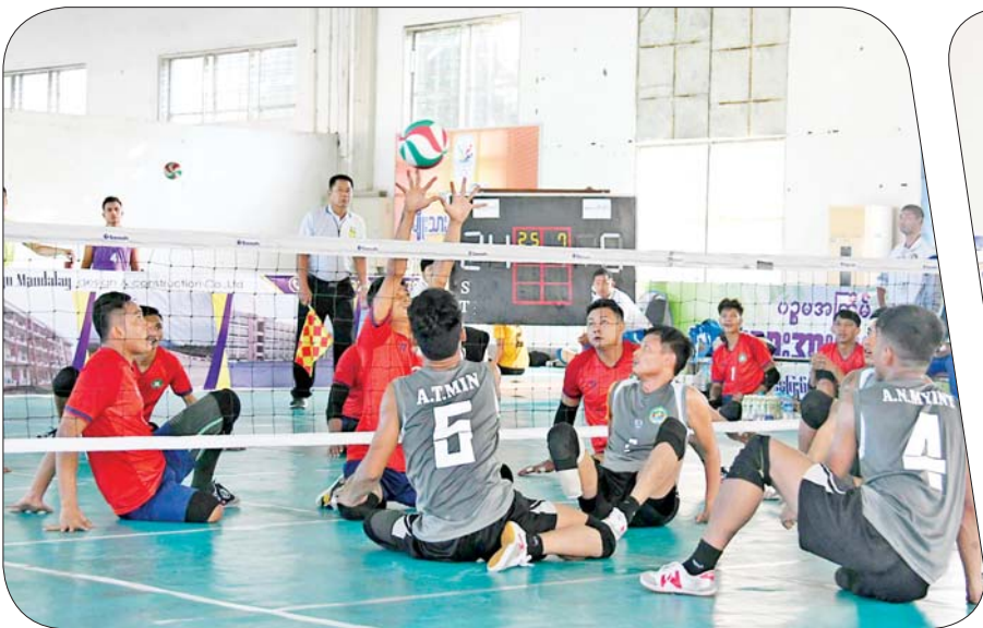
အမျိုးသား ထိုင်လျက်ဘော်လီဘောပြိုင်ပွဲတွင် နေပြည်တော်အသင်းနှင့် ဧရာဝတီတိုင်းဒေသကြီးအသင်းတို့ အကြိတ်အနယ် ယှဉ်ပြိုင်နေစဉ်။