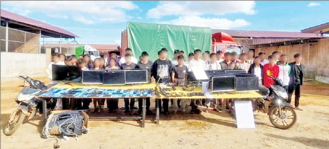
တန့်ယန်းမြို့နယ်၌ တရုတ်နိုင်ငံသား ၁၈ ဦးနှင့် မြန်မာနိုင်ငံသား ၂၇ ဦးတို့အား အွန်လိုင်းအသုံးပြု၍ ငွေလိမ်လုပ်ငန်း လုပ်ကိုင်ရာတွင်အသုံးပြုသည့် ဆက်စပ်ပစ္စည်းများ၊ လက်နက်၊ ခဲယမ်းများနှင့်အတူ ဖမ်းဆီးရမိမှုမှတ်တမ်းဓာတ်ပုံ။

နှင့်အညီ ထိရောက်စွာ အရေးယူ နိုင်ရေး တန့်ယန်းမြို့မရဲစခန်း၌ အီလက်ထရောနစ်ဆက်သွယ်ရေး ဆိုင်ရာဥပဒေပုဒ်မ ၃၃(က) ဖြင့် လည်းကောင်း၊ လဝကအက်ဥပဒေ ပုဒ်မ ၁၃(၁)ဖြင့် လည်းကောင်း အမှုဖွင့်စစ်ဆေးဆောင်ရွက်လျက် ရှိကြောင်း သိရသည်။ သတင်းစဉ်