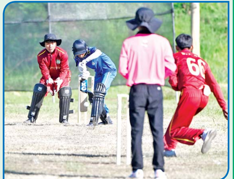
ပဉ္စမအကြိမ် အမျိုးသား အားကစားပွဲတော် ပြည်နယ်နှင့် တိုင်းဒေသကြီး အမျိုးသား ခရစ်ကက် ပြိုင်ပွဲတွင် နေပြည်တော်အသင်းနှင့် ဧရာဝတီတိုင်းဒေသကြီးအသင်းတို့ ယှဉ်ပြိုင်ကစားကြစဉ်။