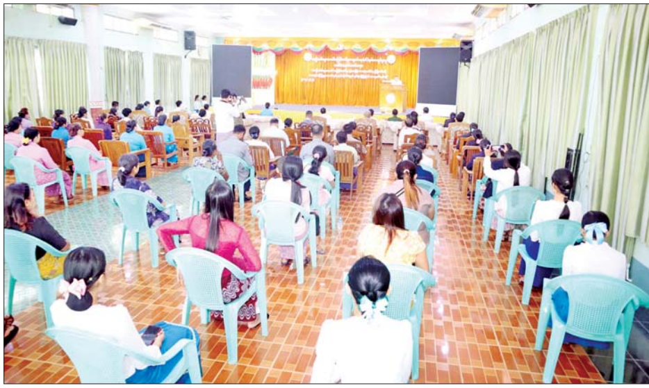
အနေဖြင့် အကြမ်းဖက်ခံရသည့် အမျိုးသမီးများကို ယာယီလက်ခံ စောင့်ရှောက်ပေးနိုင်ရေးအတွက် ထားဝယ်မြို့တွင် One Stop Women Support Center တစ်ခုကို ဖွင့်လှစ်နိုင်ရေးအတွက်ဆောင်ရွက် သွားမည်ဖြစ်ကြောင်း၊ အမျိုးသမီးများအပေါ် အကြမ်းဖက်မှုများမှ တားဆီးကာကွယ်ရေးလုပ်ငန်း

အခမ်းအနားတွင်တိုင်းဒေသကြီးဝန်ကြီးချုပ် ဦးမြတ်ကိုက နိုင်ငံလူဦးရေ၏ ထက်ဝက်ကျော်မက သော အမျိုးသမီးထုကြီး၏ ဖွံ့ဖြိုးတိုးတက်ရေး အတွက် ဆောင်ရွက်ပေးခြင်း၊ အမျိုးသမီးများအပေါ် အကြမ်းဖက်မှုမှ ကာကွယ်ပေးခြင်းများသည် မိမိတို့ နိုင်ငံ၏ စဉ်ဆက်မပြတ်ဖွံ့ဖြိုးတိုးတက်ရေးအတွက် ဆောင်ရွက်ရာတွင် အရေးကြီးသော အခန်းကဏ္ဍ တွင်ပါဝင်နေကြောင်း၊ တနင်္သာရီတိုင်းဒေသကြီး