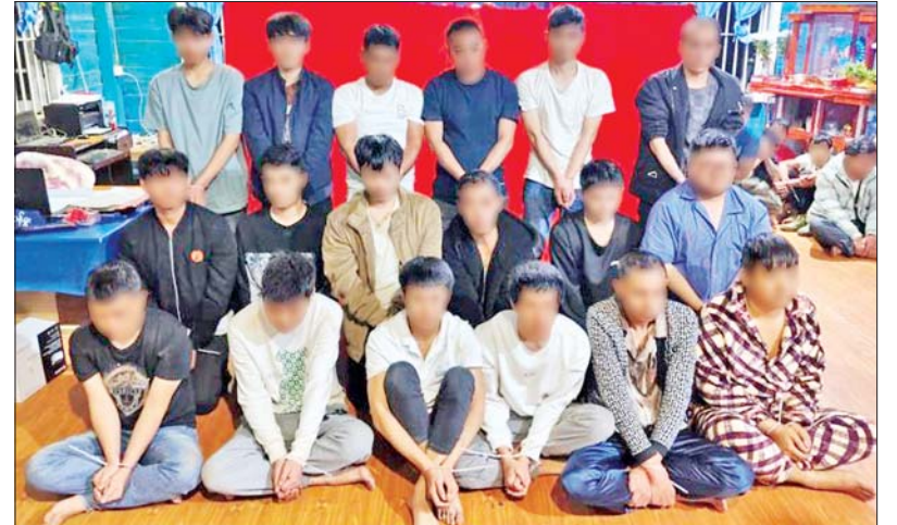
တန့်ယန်းမြို့နယ်၌ အွန်လိုင်းအသုံးပြု၍ ငွေလိမ်လုပ်ငန်းလုပ်ကိုင်နေသည့် တရုတ် နိုင်ငံသား ချိန်လှပါ အမျိုးသား ၁၈ ဦး၏ မှတ်တမ်းဓာတ်ပုံ။