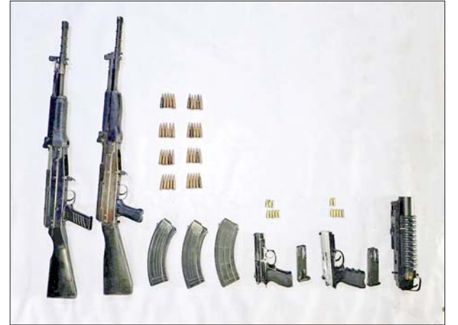
တန့်ယန်းမြို့နယ်၌ အွန်လိုင်းအသုံးပြု၍ ငွေလိမ်လုပ်ငန်းလုပ်ကိုင်သူများအား ဖမ်းဆီးရမိမှုမှ CZ 75 D 9MM အမျိုးအစားပစ္စတိုသေနတ်တစ်လက်၊ ကျည်ရှစ်တောင့်၊ Beretta 9MM အမျိုးအစားပစ္စတိုသေနတ်တစ်လက်၊ ကျည်ခုနစ်တောင့်၊ Type-81 အမျိုးအစားသေနတ်နှစ်လက်၊ ကျည်အိမ်သုံးခု၊ ကျည်တောင့် ၄၀၊ ၄၀ မမ ပြောင်းတစ်ခု သိမ်းဆည်းရမိမှု မှတ်တမ်းဓာတ်ပုံ။

ကျည်ရှစ်တောင့်၊ Beretta 9MM အမျိုးအစား ပစ္စတိုသေနတ်တစ်လက်၊ ကျည်ခုနစ်တောင့်၊ Type-81 အမျိုးအစား သေနတ်နှစ်လက်၊ ကျည်အိမ်သုံးခု၊ ကျည်တောင့် ၄၀၊ ၄၀ မမ ပြောင်းတစ်ခု၊ စကားပြောစက် ခြောက်လုံး၊ ဆိုင်ကယ်နှစ်စီး၊ မီးစက်တစ်လုံး၊