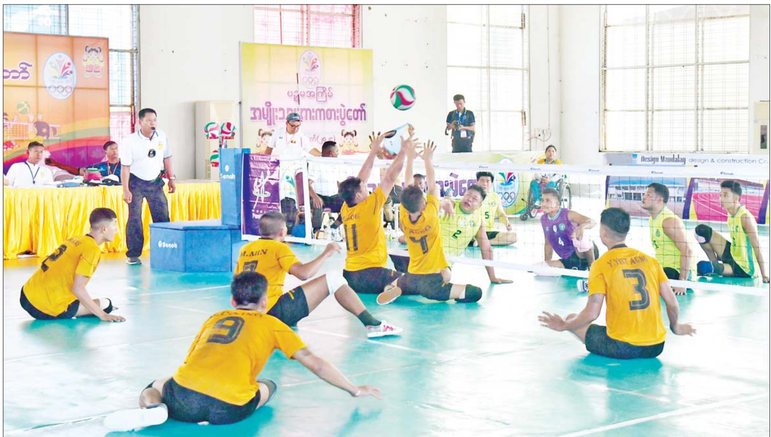
၂၀၂၄ ခုနှစ် ပဉ္စမအကြိမ် အမျိုးသားအားကစားပွဲတော် မသန်စွမ်းအားကစား တိုင်လျက်ဘော်လီဘောပြိုင်ပွဲ၌ ရန်ကုန်တိုင်းဒေသကြီးအသင်းနှင့် ပဲခူးတိုင်းဒေသကြီး အသင်းတို့ ယှဉ်ပြိုင်ကစားကြစဉ်။

နေပြည်တော် ဒီဇင်ဘာ ၅ ၂၀၂၄ ခုနှစ် ပဉ္စမအကြိမ် အမျိုးသား အားကစားပွဲတော် မသန်စွမ်းအားကစား ပြိုင်ပွဲများကို ယနေ့နံနက်ပိုင်းမှ စတင်၍ နေပြည်တော်ရှိ ဝဏ္ဏသိဒ္ဓိ ရေကူးကန်နှင့် လယ်ဝေး TC-2 အားကစားကွင်းတို့၌ ယှဉ်ပြိုင်ကစားကြရာ နိုင်ငံတော်စီမံ အုပ်ချုပ်ရေးကောင်စီ အဖွဲ့ဝင်များ တက်ရောက်ကြည့်ရှု အားပေးကြပြီး ဆုများ ပေးအပ်ချီးမြှင့်ကြသည်။ ဦးစွာ မသန်စွမ်းရေကူး(အမျိုးသား/ အမျိုးသမီး) မိတာ ၅၀ အလွတ်ကူး ပြိုင်ပွဲနှင့် ရင်ပေါင်တန်းကူးပြိုင်ပွဲတို့၏ ဗိုလ်လုပွဲစဉ်များကို ဝဏ္ဏသိဒ္ဓိရေကူးကန် ၌ ယှဉ်ပြိုင်ကစားကြရာ နိုင်ငံတော်စီမံ အုပ်ချုပ်ရေးကောင်စီအဖွဲ့ဝင်များဖြစ်ကြ သည့် ဒေါက်တာမူထန်၊ ဒေါက်တာဘရွှေ၊ အားကစားနှင့်လူငယ်ရေးရာဝန်ကြီးဌာန ပြည်ထောင်စုဝန်ကြီး ဦးမင်းသိန်းဇံ၊ ဒုတိယဝန်ကြီးများ၊ မြန်မာနိုင်ငံ ရေကူး အဖွဲ့ချုပ်မှ တာဝန်ရှိသူများ၊ ပြိုင်ပွဲဝင် အသင်းများမှ အုပ်ချုပ်သူ၊ နည်းပြများနှင့် အားကစားသမားများ တက်ရောက် ကြည့်ရှုအားပေးကြသည်။ စာမျက်နှာ ၃ ကော်လံ ၁ သို့ ❁