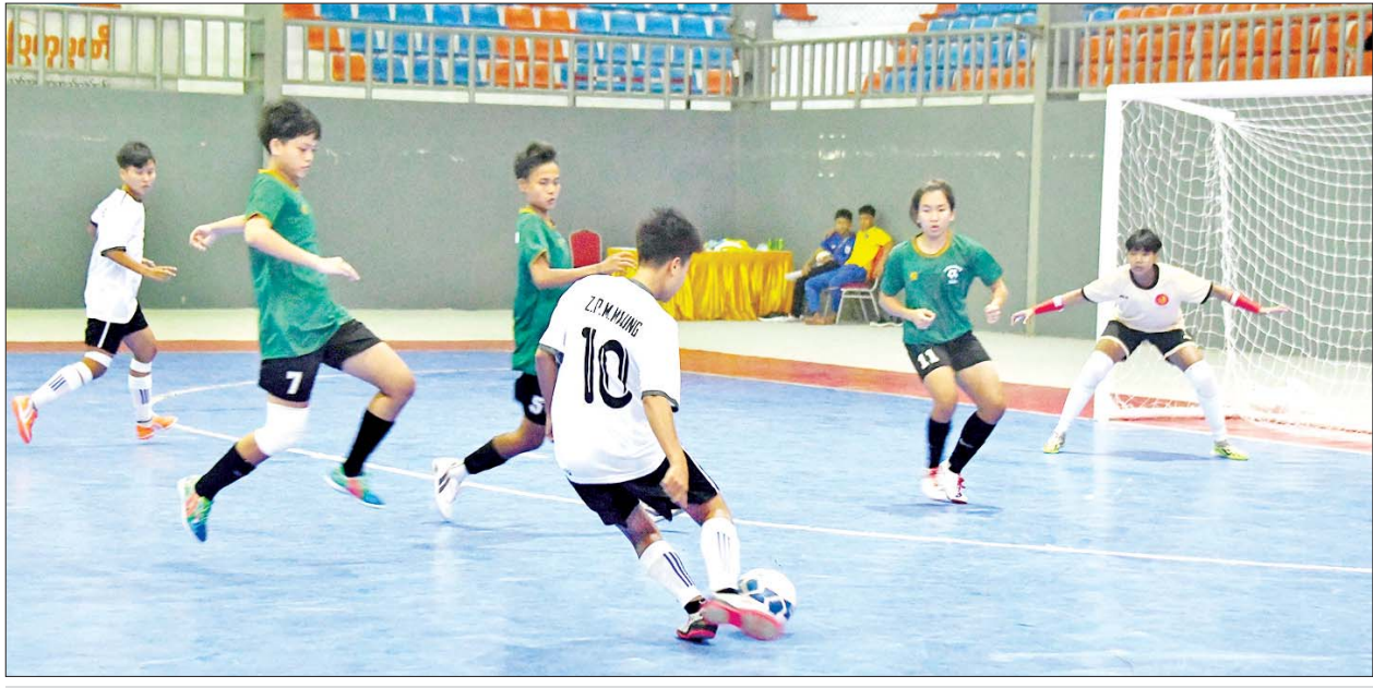
ပဉ္စမအကြိမ် အမျိုးသားအားကစားပွဲတော် ပြည်နယ်နှင့်တိုင်းဒေသကြီး အမျိုးသမီးဖူဆယ်ပြိုင်ပွဲတွင် တနင်္သာရီတိုင်းဒေသကြီးအသင်းနှင့် မွန်ပြည်နယ်အသင်းတို့ ယှဉ်ပြိုင်ကစားကြစဉ်။

အမျိုးသားနှစ်ယောက်တွဲပိုက်ကျော်ခြင်းပြိုင်ပွဲ ကွာတားဖိုင်