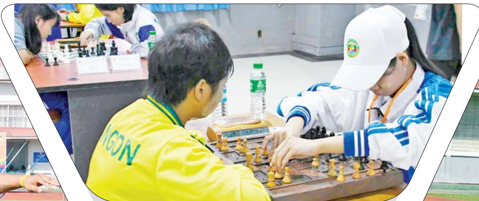
အမျိုးသမီး စစ်တုရင်ပြိုင်ပွဲတွင် ပြိုင်ပွဲဝင်များ ပါဝင်ယှဉ်ပြိုင်နေမှုကို တွေ့ရစဉ်။