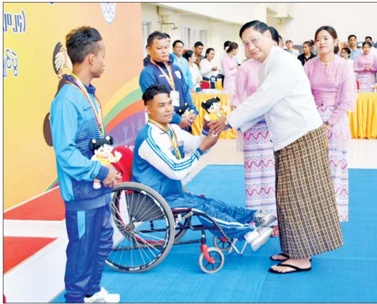
နိုင်ငံတော်စီမံအုပ်ချုပ်ရေးကောင်စီအဖွဲ့ဝင် ဒေါက်တာဘရွှေ မသန်စွမ်းရေကူး အမျိုးသား S6/7 မိတာ ၅၀ အလွတ်ကူးပြိုင်ပွဲတွင် ပထမဆုရရှိသည့် ဧရာဝတီ တိုင်းဒေသကြီးအသင်းမှ ပြိုင်ပွဲဝင်တစ်ဦးအား ဂုဏ်ပြုဆုတံဆိပ်နှင့် အမျိုးသား အားကစားပွဲတော်အထိမ်းအမှတ်အရပ် ပေးအပ်ချီးမြှင့်စဉ်။

အားပေးကြပြီး ပြိုင်ပွဲဝင်များအား ဂုဏ်ပြု ချီးမြှင့်ငွေများ ပေးအပ်ကာ မှတ်တမ်းတင် ဓာတ်ပုံရိုက်ကြသည်။ ထို့နောက် မသန်စွမ်းပြေးခုန်ပစ် ပြိုင်ပွဲ ဆုချီးမြှင့်ပွဲအခမ်းအနားကို လယ်ဝေး TC-2 အားကစားကွင်း၌ ဆက်လက်ကျင်းပရာ နိုင်ငံတော်စီမံ အုပ်ချုပ်ရေးကောင်စီ အဖွဲ့ဝင်များ၊ ပြည်ထောင်စုဝန်ကြီးများ၊ ဒုတိယဝန်ကြီး များ၊ မြန်မာနိုင်ငံ ပြေးခုန်ပစ်အဖွဲ့ချုပ်တို့မှ တာဝန်ရှိသူများ၊ ပြိုင်ပွဲဝင်အသင်းများမှ အုပ်ချုပ်သူ၊ နည်းပြများနှင့် အားကစား သမားများ တက်ရောက်ကြသည်။ စာမျက်နှာ ၄ သို့