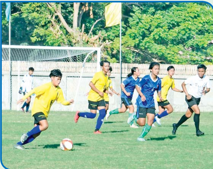
ပဉ္စမအကြိမ် အမျိုးသား အားကစားပွဲတော် ပြည်နယ်နှင့် တိုင်းဒေသကြီး အမျိုးသမီး ဘောလုံး ပြိုင်ပွဲတွင် ဧရာဝတီတိုင်းဒေသကြီး အသင်းနှင့် ကယားပြည်နယ်အသင်းတို့ ယှဉ်ပြိုင်ကစားကြစဉ်။