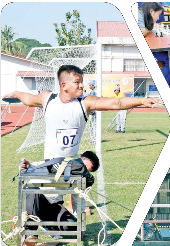
အမျိုးသား သံပြားပစ်ပြိုင်ပွဲတွင် ပြိုင်ပွဲဝင်တစ်ဦး ပါဝင်ယှဉ်ပြိုင်စဉ်။