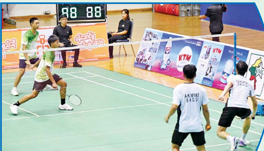
ပဉ္စမအကြိမ် အမျိုးသားအားကစားပွဲတော် ပြည်နယ်နှင့်တိုင်းဒေသကြီး အမျိုးသားကြက်တောင်ရိုက် ပြိုင်ပွဲတွင် ဧရာဝတီတိုင်းဒေသကြီးအသင်းနှင့် ပဲခူးတိုင်းဒေသကြီးအသင်းတို့ ယှဉ်ပြိုင်ကစားကြစဉ်။