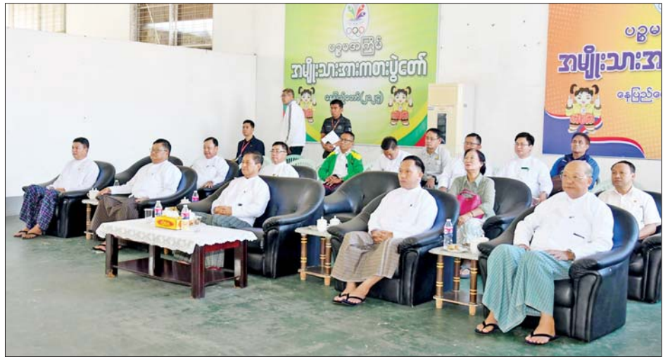
နိုင်ငံတော်စီမံအုပ်ချုပ်ရေးကောင်စီအဖွဲ့ဝင်များဖြစ်ကြသည့် ခွန်စံလွင်၊ ဦးရွှေကြိမ်းနှင့် ဦးရန်ကျော်၊ ပြည်ထောင်စုဝန်ကြီးများဖြစ်သည့် ဦးမင်းသိန်းဇံ၊ Jeng Phang နော်တောင်၊ ဒုတိယဝန်ကြီးများနှင့် တာဝန်ရှိသူများ မသန်စွမ်းအမျိုးသားထိုင်လျက်ဘော်လီဘောပြိုင်ပွဲတွင် ရန်ကုန်တိုင်းဒေသကြီးအသင်းနှင့် ပဲခူးတိုင်းဒေသကြီးအသင်းတို့ယှဉ်ပြိုင်နေမှုကို ကြည့်ရှုအားပေးကြစဉ်။

ဇွဲရုံးမှ ပြိုင်ပွဲယှဉ်ပြိုင်မှုများအပြီးတွင် ဆု ချီးမြှင့်ပွဲအခမ်းအနားကို ဆက်လက် ကျင်းပရာ ဒုတိယဝန်ကြီး ဦးထိန်လင်း က မသန်စွမ်းရေကူးအမျိုးသမီး S6/10 မိတာ ၅၀ အလွတ်ကူးပြိုင်ပွဲတွင် ပထမ ဆုရရှိသည့် ဧရာဝတီတိုင်းဒေသကြီး၊ ဒုတိယဆုရရှိသည့် ရန်ကုန်တိုင်းဒေသ ကြီး၊ တတိယဆုရရှိသည့် ပဲခူးတိုင်းဒေသ ကြီးအသင်းတို့မှ ပြိုင်ပွဲဝင်များအား လည်းကောင်း၊ ဒုတိယဝန်ကြီး ဒေါက်တာ အောင်ကြီးက အမျိုးသား S9/10 မိတာ ၅၀ ရင်ပေါင်တန်းကူးပြိုင်ပွဲတွင် ပထမဆု ရရှိသည့် ပဲခူးတိုင်းဒေသကြီး၊ ဒုတိယဆု ရရှိသည့် မန္တလေးတိုင်းဒေသကြီးနှင့် တတိယဆုရရှိသည့် ပဲခူးတိုင်းဒေသကြီး အသင်းတို့မှ ပြိုင်ပွဲဝင်များအား လည်းကောင်း ဂုဏ်ပြုဆုတံဆိပ်နှင့် အမျိုးသားအားကစားပွဲတော် အထိမ်း အမှတ်အရပ်အား ပေးအပ်ချီးမြှင့်ကြ သည်။ ထို့နောက် ပြည်ထောင်စုဝန်ကြီး ဦးမင်းသိန်းဇံက မသန်စွမ်းရေကူး အမျိုးသား S9/10 မိတာ ၅၀ အလွတ်ကူး ပြိုင်ပွဲတွင် ပထမဆုရရှိသည့် ပဲခူးတိုင်း ဒေသကြီး၊ ဒုတိယနှင့် တတိယဆုရရှိကြ သည့် ရန်ကုန်တိုင်းဒေသကြီးအသင်းတို့မှ ပြိုင်ပွဲဝင်များအားလည်းကောင်း ဂုဏ်ပြု ဆုတံဆိပ်နှင့် အမျိုးသားအားကစား ပွဲတော် အထိမ်းအမှတ်အရပ်အား ပေးအပ်ချီးမြှင့်သည်။ ယင်းနောက် နိုင်ငံတော်စီမံအုပ်ချုပ် ရေးကောင်စီအဖွဲ့ဝင် ဒေါက်တာဘရွှေက မသန်စွမ်းရေကူး အမျိုးသား S6/7 မိတာ