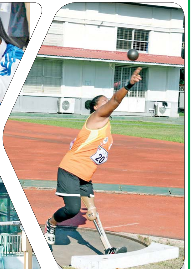
အမျိုးသမီး သံလုံးပစ်ပြိုင်ပွဲတွင် ပြိုင်ပွဲဝင်တစ်ဦး ပါဝင်ယှဉ်ပြိုင်စဉ်။