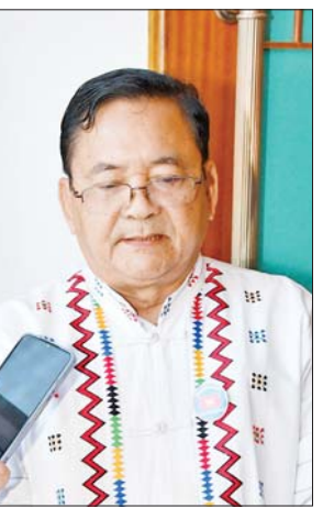
ဦးခေါတ်န့်