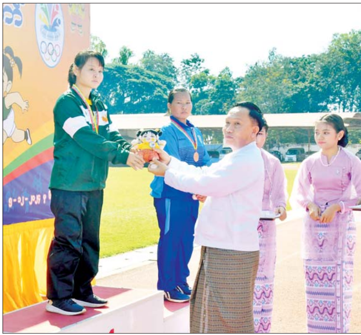
နိုင်ငံတော်စီမံအုပ်ချုပ်ရေးကောင်စီအဖွဲ့ဝင် ဦးရွှေကြိမ်း အမျိုးသမီးသံလုံးပစ် F 44/62/63/64 ပြိုင်ပွဲတွင် ပထမဆုရရှိသည့် မွန်ပြည်နယ်မှ ပြိုင်ပွဲဝင်တစ်ဦးအား ဂုဏ်ပြုဆုတံဆိပ်နှင့် အမျိုးသားအားကစားပွဲတော်အထိမ်းအမှတ်အရုပ် ပေးအပ်ချီးမြှင့်စဉ်။

ကြီးနှင့် တတိယဆုရရှိသည့် ဧရာဝတီတိုင်းဒေသကြီးတို့မှ ပြိုင်ပွဲဝင်များအားလည်းကောင်း ဂုဏ်ပြုဆုတံဆိပ်နှင့် အမျိုးသားအားကစားပွဲတော် အထိမ်းအမှတ်အရုပ်အား ပေးအပ်ချီးမြှင့်သည်။ ဆက်လက်၍ နိုင်ငံတော်စီမံအုပ်ချုပ်ရေးကောင်စီအဖွဲ့ဝင် ဦးရွှေကြိမ်းက အမျိုးသမီးသံလုံးပစ် F 44/62/63/64 ပြိုင်ပွဲတွင် ပထမဆုရရှိသည့် မွန်ပြည်နယ်၊ ဒုတိယဆုရရှိသည့် ပြည်ထောင်စုနယ်မြေ နေပြည်တော်နှင့် တတိယဆုရရှိသည့် ပဲခူးတိုင်းဒေသကြီးအသင်းတို့မှ ပြိုင်ပွဲဝင်များအားလည်းကောင်း၊ အမျိုးသမီးမိတာ ၂၀၀ T 44/64 အပြေးပြိုင်ပွဲတွင် ပထမဆုရရှိသည့် ဧရာဝတီတိုင်းဒေသကြီး၊ ဒုတိယဆုရရှိသည့် မွန်ပြည်နယ်နှင့် တတိယဆုရရှိသည့် ဧရာဝတီတိုင်းဒေသကြီးအသင်းတို့မှ ပြိုင်ပွဲဝင်များအားလည်းကောင်း ဂုဏ်ပြုဆုတံဆိပ်နှင့် အမျိုးသားအားကစားပွဲတော် အထိမ်းအမှတ်အရုပ်အား ပေးအပ်ချီးမြှင့်သည်။