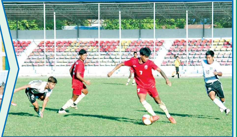
ပဉ္စမအကြိမ် အမျိုးသားအားကစားပွဲတော် ဝန်ကြီးဌာနပေါင်းစုံ အလွတ်တန်း အမျိုးသား ဘောလုံး ပြိုင်ပွဲတွင် ပြည်ထဲရေးဝန်ကြီးဌာနအသင်းနှင့် နယ်စပ်ရေးရာဝန်ကြီးဌာနအသင်းတို့ ယှဉ်ပြိုင်ကစားကြစဉ်။