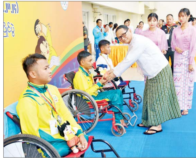
နိုင်ငံတော်စီမံအုပ်ချုပ်ရေးကောင်စီအဖွဲ့ဝင် ဒေါက်တာမူထန် မသန်စွမ်းရေကူး အမျိုးသား S4/5 မိတာ ၅၀ အလွတ်ကူးပြိုင်ပွဲတွင် ပထမဆုရရှိသည့် ရန်ကုန်တိုင်း ဒေသကြီးအသင်းမှ ပြိုင်ပွဲဝင်တစ်ဦးအား ဂုဏ်ပြုဆုတံဆိပ်နှင့် အမျိုးသား အားကစားပွဲတော်အထိမ်းအမှတ်အရပ် ပေးအပ်ချီးမြှင့်စဉ်။