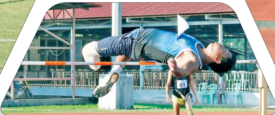
အမျိုးသား တန်းမြင့်ခုန် ပြိုင်ပွဲတွင် ပြိုင်ပွဲဝင်တစ်ဦး ပါဝင်ယှဉ်ပြိုင်စဉ်။