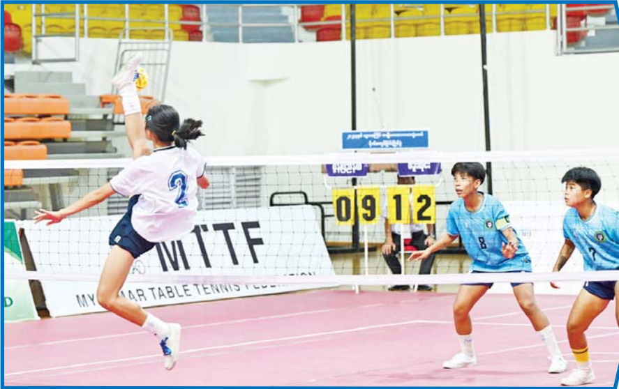
ပဉ္စမအကြိမ် အမျိုးသားအားကစားပွဲတော် ပြည်နယ်နှင့် တိုင်းဒေသကြီး အမျိုးသမီး ပိုက်ကျော်ခြင်း ပြိုင်ပွဲတွင် မွန်ပြည်နယ်အသင်းနှင့် ပဲခူးတိုင်းဒေသကြီးအသင်းတို့ ယှဉ်ပြိုင်ကစားကြစဉ်။