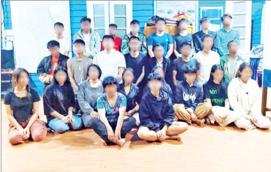
တန့်ယန်းမြို့နယ်၌ အွန်လိုင်းအသုံးပြု၍ ငွေလိမ်လုပ်ငန်းလုပ်ကိုင်နေသည့် မြန်မာနိုင်ငံသား အားဖျင် (ခ)စောက်ရီချုံပါ အမျိုးသား ၁၇ ဦးနှင့် အမျိုးသမီး ၁၀ ဦး၏ မှတ်တမ်းဓာတ်ပုံ။

ထိုသို့ ဆောင်ရွက်လျက်ရှိရာ ၂၀၂၄ ခုနှစ် ဒီဇင်ဘာ ၂ ရက် မွန်းလွဲ ၁ နာရီ ၁၅ မိနစ်တွင် လုံခြုံရေးတပ်ဖွဲ့ဝင်များ ပါဝင်သော ပူးပေါင်းအဖွဲ့သည် ရှမ်းပြည်နယ် (မြောက်ပိုင်း) တန့်ယန်းမြို့နယ် နောင်ဟီးကျေးရွာရှိ နေအိမ်တစ်လုံး၌ တရုတ်နိုင်ငံသားများနှင့် မြန်မာနိုင်ငံသားများ ပူးပေါင်းကာ အွန်လိုင်းအသုံးပြု၍ ငွေလိမ်လုပ်ငန်းများ လုပ်ကိုင်နေကြောင်း သတင်းရရှိသဖြင့် အဆိုပါနေအိမ်အား သက်သေများနှင့်အတူ ဝင်ရောက်ရှာဖွေစစ်ဆေးခဲ့သည်။