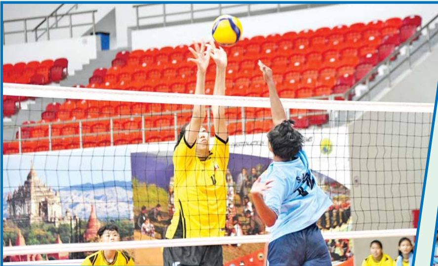
ပဉ္စမအကြိမ် အမျိုးသားအားကစားပွဲတော် ပြည်နယ်နှင့် တိုင်းဒေသကြီး အမျိုးသမီး ဘော်လီဘော ပြိုင်ပွဲတွင် မန္တလေးတိုင်းဒေသကြီးအသင်းနှင့် ရှမ်းပြည်နယ်အသင်းတို့ ယှဉ်ပြိုင်ကစားကြစဉ်။