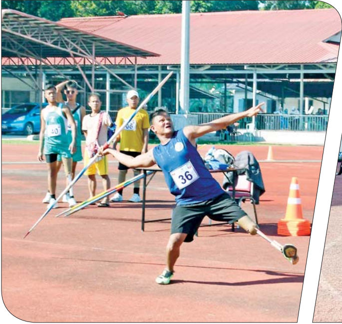
အမျိုးသား လှံတံပစ်ပြိုင်ပွဲတွင် ပြိုင်ပွဲဝင်တစ်ဦး ပါဝင်ယှဉ်ပြိုင်စဉ်။

၂၀၂၄ ခုနှစ် ပဉ္စမအကြိမ် အမျိုးသားအားကစားပွဲတော် မသန်စွမ်းအားကစားပြိုင်ပွဲများကို ဒီဇင်ဘာ ၅ ရက် နံနက်ပိုင်းမှစတင်၍ နေပြည်တော်ရှိ ဝဏ္ဏသိဒ္ဓိရေကူးကန်နှင့် လယ်ဝေး TC-2 အားကစားကွင်းတို့၌ ယှဉ်ပြိုင်ကစားကြသည်။