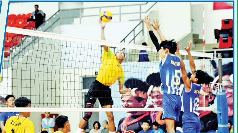
ပဉ္စမအကြိမ် အမျိုးသားအားကစားပွဲတော် ပြည်နယ်နှင့် တိုင်းဒေသကြီး အမျိုးသားဘော်လီဘော ပြိုင်ပွဲတွင် ရခိုင်ပြည်နယ်အသင်းနှင့် ကချင်ပြည်နယ်အသင်းတို့ ယှဉ်ပြိုင်ကစားကြစဉ်။