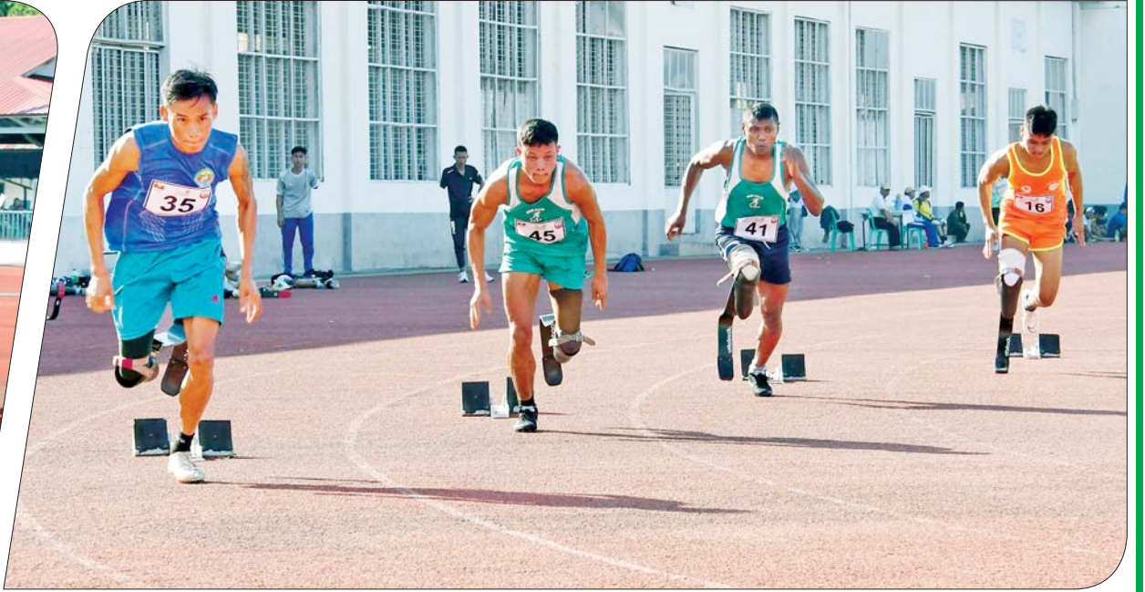
အမျိုးသား မိတာ ၂၀၀ အပြေးပြိုင်ပွဲ ကျင်းပစဉ်။