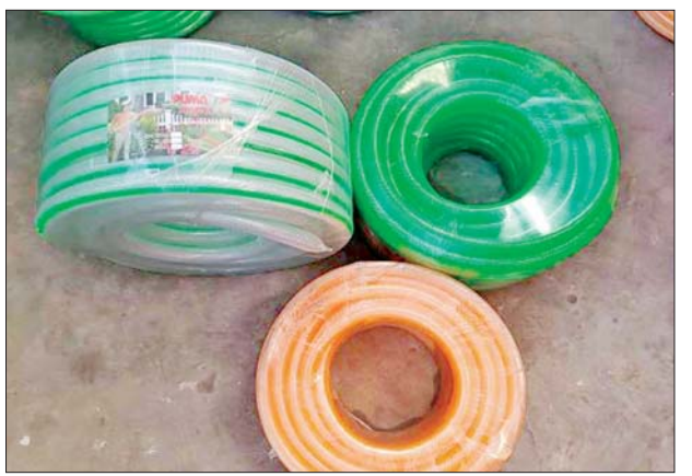
မြန်မာ့စက်မှုဆိပ်ကမ်း၌ သိမ်းဆည်းရမိမှု။

ထို့အတူ မန္တလေးတိုင်းဒေသကြီး တရားမဝင်ကုန်သွယ်မှုတိုက်ဖျက်ရေးအထူးအဖွဲ့၏ စီမံခန့်ခွဲမှုဖြင့် တာဝန်ကျပူးပေါင်းအဖွဲ့က စစ်ဆေးမှုများ ဆောင်ရွက်ခဲ့ရာ ရန်ကုန်-မန္တလေးအမြန်လမ်း မိုင်တိုင်အမှတ် (၃၆၄/၁)၌ ယာဉ်တစ်စီးပေါ်မှ တရားဝင်စာရွက်စာတမ်းအထောက်အထားတင်ပြနိုင်ခြင်းမရှိသည့် လူသုံးကုန်ပစ္စည်းလေးမျိုး (ခန့်မှန်းတန်ဖိုးငွေကျပ် ၂၅၇၆၃၅၀၀) နှင့် အဆိုပါပစ္စည်းများ တင်ဆောင်လာသည့် Higer Bus တစ်စီး (ခန့်မှန်းတန်ဖိုးငွေကျပ် ၅၀၀၀၀၀၀)