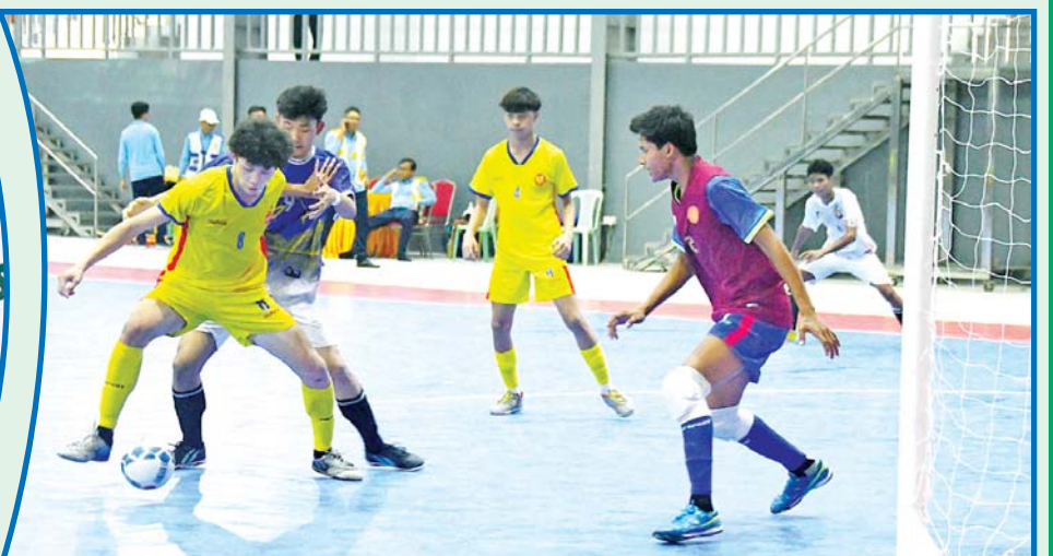
ပဉ္စမအကြိမ် အမျိုးသားအားကစားပွဲတော် ပြည်နယ်နှင့် တိုင်းဒေသကြီး အမျိုးသား ဖူဆယ်ပြိုင်ပွဲ တွင် မွန်ပြည်နယ်အသင်းနှင့် စစ်ကိုင်းတိုင်းဒေသကြီးအသင်းတို့ ယှဉ်ပြိုင်ကစားကြစဉ်။