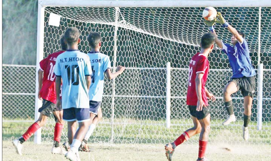
ပဉ္စမအကြိမ် အမျိုးသားအားကစားပွဲတော် ပြည်နယ်နှင့်တိုင်းဒေသကြီး အမျိုးသားဘောလုံးပြိုင်ပွဲတွင် ပဲခူးတိုင်းဒေသကြီးအသင်းနှင့် တနင်္သာရီတိုင်းဒေသကြီးအသင်းတို့ ယှဉ်ပြိုင်ကစားကြစဉ်။

နယ်ပွဲစဉ်တွင် ပြည်ထောင်စုနယ်မြေ နေပြည်တော်အသင်းက ပဲခူးတိုင်းဒေသကြီးအသင်းကို နှစ်ပွဲတစ်ပွဲ၊ ကရင်ပြည်နယ်အသင်းက ချင်းပြည်နယ်အသင်းကို နှစ်ပွဲပြတ်၊ မွန်ပြည်နယ်အသင်းက ရခိုင်ပြည်နယ်အသင်းကို နှစ်ပွဲပြတ်၊ တနင်္သာရီတိုင်းဒေသကြီး အသင်းက ပြည်ထောင်စုနယ်မြေ နေပြည်တော်အသင်းကို နှစ်ပွဲပြတ်၊ စစ်ကိုင်းတိုင်းဒေသကြီး အသင်းက ကရန်ကုန်တိုင်းဒေသကြီးအသင်းကို နှစ်ပွဲပြတ်ဖြင့် လည်းကောင်း၊ အမျိုးသမီးနှစ်ယောက်