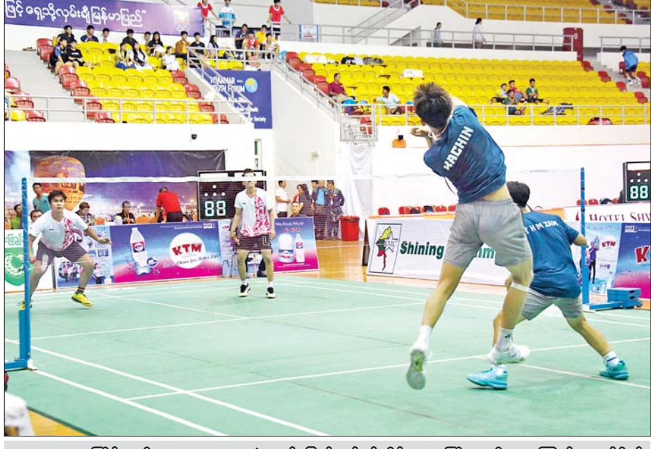
ပဉ္စမအကြိမ်အမျိုးသားအားကစားပွဲတော် ပြည်နယ်နှင့်တိုင်းဒေသကြီး အမျိုးသားကြက်တောင်ရိုက်ပြိုင်ပွဲတွင် ကချင်ပြည်နယ်အသင်းနှင့် တနင်္သာရီတိုင်းဒေသကြီးအသင်းတို့ ယှဉ်ပြိုင်ကစားကြစဉ်။