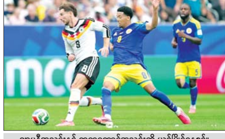
ဂျာမနီအသင်းနှင့် ကျရာကောင်အသင်းတို့ ယှဉ်ပြိုင်နေစဉ်။

ရန်ကုန် ဇွန် ၁၅ မြန်မာနိုင်ငံဘောလုံးအဖွဲ့ချုပ် မြန်မာနေရှင်နယ်လိဂ်က ကြီးမှူး၍ Max Energy ၏ အဓိကပံ့ပိုးကူညီမှုဖြင့်ကျင်းပသည့် ၂၀၂၆-၂၀၂၇ ရာသီ မြန်မာအမျိုးသမီးလိဂ်ပြိုင်ပွဲ ပွဲစဉ်(၁) ပထမနေ့ကို ဇွန် ၁၅ ရက်က သုဝဏ္ဏကွင်း၌ကျင်းပရာ အား/ကာသိပွဲအသင်းက ရှမ်းယူနိုက်တက်အသင်းကို လေးဂိုး-တစ်ဂိုးဖြင့် ဂိုးပြတ်အနိုင်ရခဲ့သည်။ ချန်ပီယံဆု သုံးကြိမ်ရဖူးသည့် အား/ကာသိပွဲအသင်းသည် ဂိုးပြတ်ရလဒ်ဖြင့် အဖွင့်လှခဲ့ပြီး သုံးမှတ်အပြည့်ရယူနိုင်ခဲ့သည်။ ရှမ်းယူနိုက်တက်အသင်းသည် ဦးဆောင်ဂိုးသွင်းယူနိုင်သော်လည်း အနိုင်ရလဒ်ကို ဖယ်နိုင်သဖြင့် ဂိုးများပြန်ပေးရကာ ရှုံးနိမ့်ခဲ့ခြင်းဖြစ်သည်။ စာမျက်နှာ ၁၈ ကော်လံ ၁ သို့ ❖