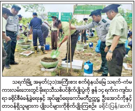
သရက်မြို့ အမှတ်(၃၁)အကြီးစား စက်ရုံနယ်မြေ သရက်-ကံမ ကားလမ်းဘေးတွင် ဦးရာသီသစ်ပင်စိုက်ပျိုးပွဲကို ဇွန် ၁၄ ရက်က ကျင်းပ ရာ ခရိုင်စီမံခန့်ခွဲရေးနှင့် အုပ်ချုပ်ရေးကော်မတီဥက္ကဋ္ဌ ဦးအောင်ကိုနှင့် တာဝန်ရှိသူများက ပျံပေါင်းစုစိုက်ပျိုးကြစဉ်။ ခရိုင်(ပြန်/ဆက်)

ကလေး ဇွန် ၁၅ ရမ်းပြည်နယ်(တောင်ပိုင်း) ကလေးမြို့နယ် ဟံဟီးမြို့၊ ဘုရားပျို ကျေးရွာ၌ ဇွန် ၁၃ ရက် နံနက်ပိုင်းက မိုးစပါးစိုက်ပျိုးလျက်ရှိသည့် သမဝါယမအသင်းသား တောင်သူများအား တာဝန်ရှိသူများက သွင်းအားစုများ ပေးအပ်သည်။ ဦးစွာ ရမ်းပြည်နယ်သမဝါယမဦးစီးဌာနမှ ပြည်နယ်ဦးစီးမှူး ဦးကျော်မိုးတင်က အမှာစကားပြောကြားပြီး ကလေးမြို့နယ် သမဝါယမဦးစီးဌာနမှ ဦးစီးအရာရှိ မြို့နယ်သမဝါယမအသင်းစုမှ ဥက္ကဋ္ဌနှင့်တာဝန်ရှိသူများက မိုးစပါးစိုက်စက ၄၀၀ အတွက် ကျပ်သိန်း ၁၂၀၀ နှင့်ညီမျှသော သွင်းအားစုများကို သမဝါယမအသင်းသား တောင်သူများအား ပေးအပ်ခဲ့ကြောင်း သိရသည်။ ကျော်ဝင်း(ကလေး)