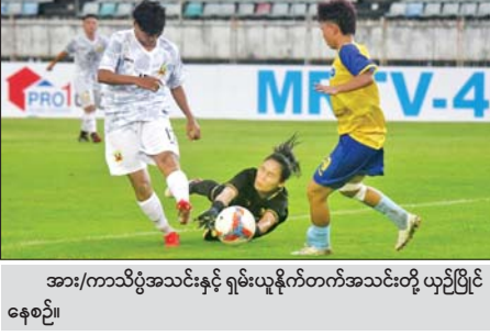
အား/ကာသိပွဲအသင်းနှင့် ရှမ်းယူနိုက်တက်အသင်းတို့ ယှဉ်ပြိုင်နေစဉ်။

ရန်ကုန် ဇွန် ၁၅ မြန်မာနိုင်ငံဘောလုံးအဖွဲ့ချုပ် မြန်မာနေရှင်နယ်လိဂ်က ကြီးမှူး၍ Max Energy ၏ အဓိကပံ့ပိုးကူညီမှုဖြင့်ကျင်းပသည့် ၂၀၂၆-၂၀၂၇ ရာသီ မြန်မာအမျိုးသမီးလိဂ်ပြိုင်ပွဲ ပွဲစဉ်(၁) ပထမနေ့ကို ဇွန် ၁၅ ရက်က သုဝဏ္ဏကွင်း၌ကျင်းပရာ အား/ကာသိပွဲအသင်းက ရှမ်းယူနိုက်တက်အသင်းကို လေးဂိုး-တစ်ဂိုးဖြင့် ဂိုးပြတ်အနိုင်ရခဲ့သည်။ ချန်ပီယံဆု သုံးကြိမ်ရဖူးသည့် အား/ကာသိပွဲအသင်းသည် ဂိုးပြတ်ရလဒ်ဖြင့် အဖွင့်လှခဲ့ပြီး သုံးမှတ်အပြည့်ရယူနိုင်ခဲ့သည်။ ရှမ်းယူနိုက်တက်အသင်းသည် ဦးဆောင်ဂိုးသွင်းယူနိုင်သော်လည်း အနိုင်ရလဒ်ကို ဖယ်နိုင်သဖြင့် ဂိုးများပြန်ပေးရကာ ရှုံးနိမ့်ခဲ့ခြင်းဖြစ်သည်။ စာမျက်နှာ ၁၈ ကော်လံ ၁ သို့ ❖