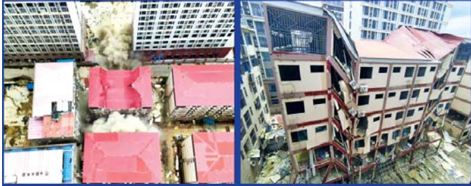
ကရင်ပြည်နယ် မြဝတီမြို့နယ် ရွှေကုက္ကိုလ်နယ်မြေရှိ အွန်လိုင်းလိမ်လည်လောင်းကစားမှု လုပ်ကိုင်ခဲ့သည့် တရားမဝင် ခုနစ်ထပ်လူနေအဆောက်အအုံအား ဖြိုချက်ဆီးတွေ့ရစဉ်။

နေပြည်တော် ဇွန် ၁၅ အွန်လိုင်း လိမ်လည်လောင်းကစားမှုများကို အခြေချ လုပ်ကိုင်ခဲ့ကြသည့် ကရင်ပြည်နယ် မြဝတီမြို့နယ် ရွှေကုက္ကိုလ်နယ်မြေနှင့် KK Park နယ်မြေများရှိ တရားမဝင် အဆောက်အအုံများအား အပြီးတိုင် ဖြိုချချက်ဆီးခြင်းများနှင့် လုပ်ငန်းလုပ်ဆောင်ရာတွင် အသုံးပြုခဲ့သည့် ပစ္စည်းများအား စနစ်တကျ ဖျက်ဆီးခြင်းများကို စာမျက်နှာ ၁၅ ကော်လံ ၄ သို့ ❖