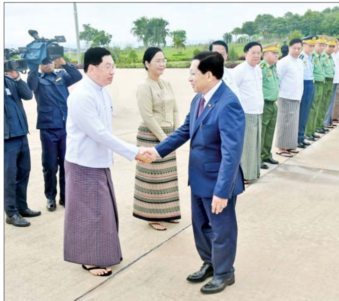
ဦးဆောင်သော မြန်မာအဆင့်မြင့် ကိုယ်စားလှယ်အဖွဲ့ လိုက်ပါလာ

ကြီးရဲဝင်းဦး၊ ပြည်ထောင်စုဝန်ကြီး များ၊ နေပြည်တော်ကောင်စီဥက္ကဋ္ဌ၊ နေပြည်တော် တိုင်းစစ်ဌာနချုပ် တိုင်းမှူးနှင့် မြန်မာနိုင်ငံဆိုင်ရာ တရုတ်ပြည်သူ့သမ္မတနိုင်ငံသံရုံး နှင့် စစ်သံရုံးတို့မှ တာဝန်ရှိသူ များက လေဆိပ်တွင် ပို့ဆောင် နှုတ်ဆက်ကြသည်။ ပြည်ထောင်စုသမ္မတ မြန်မာ နိုင်ငံတော် နိုင်ငံတော်သမ္မတနှင့် အတူ ပြည်ထောင်စုဝန်ကြီးများ ဖြစ်ကြသည့် ဦးခင်မောင်ရီ၊ ဦးတင်မောင်ဆွေ၊ ဒေါက်တာ မှ အထူးလေယာဉ်ဖြင့် ထွက်ခွာ ကြသည်။ ပြည်နယ် ဝန်ကြီးချုပ် ဦးခင်ထိန်နန်၊ ရှမ်းပြည်နယ် ဝန်ကြီးချုပ် ဦးစိုင်းထိန်စိုး၊ ကာကွယ် ရေးဦးစီးချုပ်ရုံးမှ အဆင့်မြင့် တပ်မတော် အရာရှိကြီးများ၊ ဒုတိယဝန်ကြီးများနှင့် တာဝန်ရှိ သူများ ခရီးစဉ်တွင် လိုက်ပါသွား ကြသည်။ ထို့နောက် နိုင်ငံတော်သမ္မတ