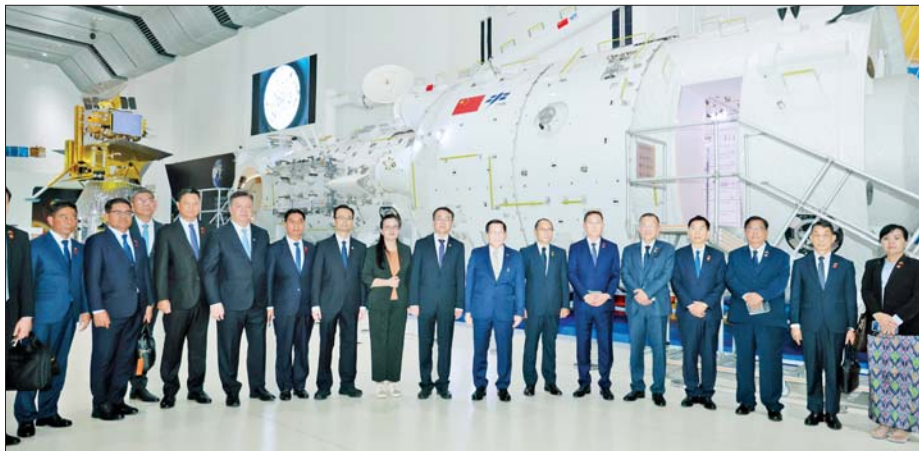
နိုင်ငံတော်သမ္မတ ဦးမင်းအောင်လှိုင် ဦးဆောင်သည့် မြန်မာအဆင့်မြင့် ကိုယ်စားလှယ်အဖွဲ့နှင့် တရုတ်အာကာသသိပ္ပံနှင့် နည်းပညာကော်ပိုရေးရှင်း (CASC) ၌ Aerospace City ၏ အမှုဆောင်ချုပ်ဖြစ်သူ မစ္စတာ ကျိုးကျနှင့် တာဝန်ရှိသူများ စုပေါင်းမှတ်တမ်းတင် ဓာတ်ပုံရိုက်စဉ်။

ပို့ဆောင်ရေးစနစ် အနေဖြင့် တရုတ်အာကာသ ယာဉ်များ၏ အဓိကမဏ္ဍိုင်ဖြစ်သော ချန်ကျန်း (Changzheng) တာဝေးပစ်ဒုံးယာဉ်များ၏ ဒီဇိုင်းပြုလုပ်ခြင်းနှင့် ထုတ်လုပ်ခြင်း၊ မောင်းနှင်သူလိုက်ပါသော အာကာသယာဉ် ယာဉ်များနှင့် စူးစမ်းလေ့လာရေး လုပ်ငန်းများအနေဖြင့် ထျန်းကွန်း (Tiangong) အာကာသစခန်း တည်ဆောက်ခြင်း၊ ချန်အာ (Chang'e) လသို့ စူးစမ်းလေ့လာရေးလုပ်ငန်းများ ဆောင်ရွက်ခြင်း၊ ထျန်းဝမ် (Tianwen) မားစီသို့ စူးစမ်းလေ့လာရေး လုပ်ငန်းများ ဆောင်ရွက်ခြင်း၊ ဂြိုဟ်တုစနစ်များဖြစ်သည့် ပေသို (BeiDou) ဂြိုဟ်တုစနစ် ပတ်လမ်းကြောင်း အပါအဝင်၊ ကောင်းဖန်း (Gaofen) ကမ္ဘာကို လေ့လာသော ဂြိုဟ်တုနှင့် ဆက်သွယ်ရေးဂြိုဟ်တုများ ထုတ်လုပ်ခြင်းနှင့် စီမံဆောင်ရွက်ခြင်းတို့ကို ဆောင်ရွက်နိုင်ခဲ့ပြီး အာကာသနည်းပညာအသုံးချမှုအနေဖြင့် သတင်းအချက်အလက် နည်းပညာ၊ စွမ်းအင်သစ်၊ အဆင့်မြင့်ထုတ်ကုန်များနှင့် ပတ်ဝန်းကျင်အကာအကွယ်ပေးရေး ဆိုင်ရာ အထောက်အကူပြု ကိရိယာများ ထုတ်လုပ်ခြင်းတို့ကို အရပ်ဘက် ကဏ္ဍများအထိ နည်းပညာ ကျယ်ပြန့်စွာ အသုံးချနိုင်ရေးတို့အတွက် အဓိကထားဆောင်ရွက်လျက်ရှိကြောင်းသိရှိရပြီး မြန်မာနိုင်ငံ သို့လည်း အာကာသနည်းပညာဆိုင်ရာများ ပြန်ဝေပေးခြင်း၊ အာကာသနည်းပညာဆိုင်ရာ ပညာတော်သင် သင်တန်းသားများ ခေါ်ယူလေ့ကျင့်သင်ကြားပေးခြင်း၊ စိုက်ပျိုးမွေးမြူရေးလုပ်ငန်းများ ဖွံ့ဖြိုးတိုးတက်ရေးအတွက် လိုအပ်သည့် သစ်တော၊ ရာသီဥတု၊ ရေအရင်းအမြစ်နှင့် ပထဝီဆိုင်ရာ အချက်အလက်များကို ဂြိုဟ်တုနည်းပညာအသုံးပြု၍ တိုးတက်မြှင့်တင်ရေးအောင် ဆောင်ရွက်ခြင်းတို့၌ ပူးပေါင်းဆောင်ရွက်လျက်ရှိကြောင်း သိရသည်။