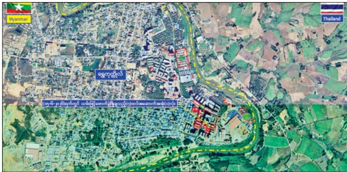
ကရင်ပြည်နယ် မြဝတီမြို့နယ် ရွှေကုက္ကိုလ်နယ်မြေရှိ အွန်လိုင်းလိမ်လည်လောင်းကစားမှုများ လုပ်ကိုင်ခဲ့သည့် တရားမဝင် အဆောက်အအုံများအား ဖောက်ခွဲဖျက်ဆီးမှု။

ရွှေကုက္ကိုလ်နယ်မြေမှ ဌာနဆိုင်ရာ ပူးပေါင်းအဖွဲ့များဖြင့် ဆောင်ရွက်လျက်ရှိရာ ယနေ့တွင် ရွှေကုက္ကိုလ်နယ်မြေ အတွင်းရှိ တရားမဝင် ခုနစ်ထပ်လူနေ အဆောက်အအုံ တစ်လုံးကို ထပ်မံ၍ စနစ်တကျ ဖောက်ခွဲ ဖြိုဖျက်ဆီးခဲ့ကြောင်း သိရ သည်။ ရွှေကုက္ကိုလ် နယ်မြေအတွင်း၌ အွန်လိုင်းလိမ်လည်လောင်းကစား လုပ်ငန်းများ ကျူးလွန်ရာတွင် အသုံးပြုခဲ့သည့် အဆောက်အအုံ ၇၇ လုံးအနက် ယာဉ်ယန္တရားများ ဖြင့် ဖြိုဖျက်ဖျက်ဆီးမည့် အဆောက် အအုံ ၅၇ လုံးနှင့် ဖောက်ခွဲ၍ ဖျက်ဆီးမည့် အဆောက်အအုံ