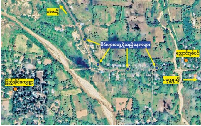
မကွေးတိုင်းဒေသကြီး ပခုက္ကူမြို့နှင့် ကံမမြို့နယ်သို့ ဆက်သွယ်ထားသည့် ကားလမ်းမကြီးပေါ်၌ PDF အမည်ခံ အကြမ်းဖက်သောင်းကျန်းသူ ပူးပေါင်းအဖွဲ့ ထောင်ထားသည့် လက်လုပ်ခိုင်းမျိုးစုံ ၄၆ လုံးအား လုံခြုံရေးတပ်ဖွဲ့ဝင်များက ဖယ်ရှားရှင်းလင်းခဲ့မှုကို တွေ့ရစဉ်။