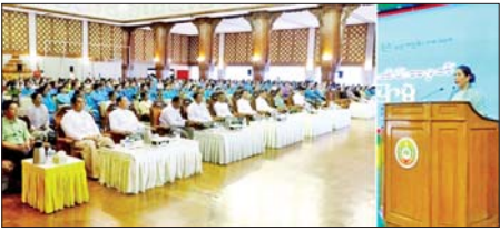
ရန်ကုန် ဇွန် ၁၅

ရန်ကုန်တိုင်းဒေသကြီး အမျိုးသမီးရေးရာအဖွဲ့မှ ဦးဆောင်ကျင်းပသည့် မြန်မာအမျိုးသမီးများနေ့အကြို စာပေဟောပြောပွဲကို ယနေ့ မွန်းလွဲပိုင်းက ရန်ကုန်တိုင်းဒေသကြီးအစိုးရအဖွဲ့ရုံး မင်္ဂလာဒုံမဏိ