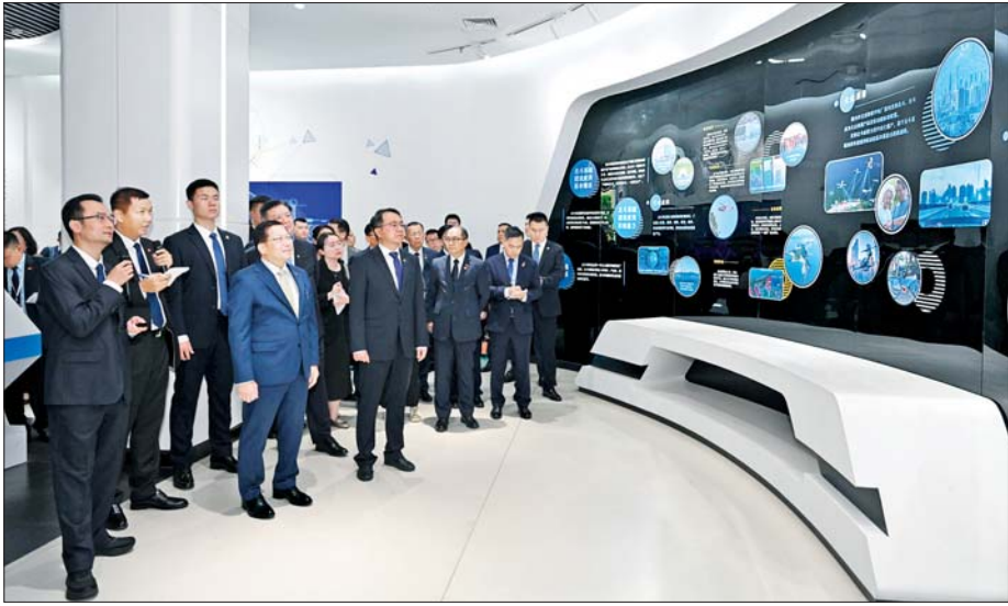
နိုင်ငံတော်သမ္မတ ဦးမင်းအောင်လှိုင် ဦးဆောင်သည့် မြန်မာအဆင့်မြင့် ကိုယ်စားလှယ်အဖွဲ့ ပေကျင်းမြို့ရှိ အာကာသမြို့တော်(Aerospace City) တွင် ကြည့်ရှုလေ့လာစဉ်။

ယင်းနောက် Aerospace City မှ အမှုဆောင်ချုပ်နှင့် တာဝန်ရှိသူများက Aerospace City ဆိုင်ရာ အချက်အလက်များကို ရှင်းလင်းတင်ပြကြပြီး Aerospace City ဆိုင်ရာ Video Clip ကို ဖွင့်လှစ်ပြသရာ နိုင်ငံတော်သမ္မတနှင့် အဖွဲ့ဝင်များက ကြည့်ရှုလေ့လာပြီး