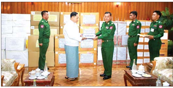
နိုင်ငံတော်စီမံအုပ်ချုပ်ရေးကောင်စီအဖွဲ့ဝင် ပြည်ထောင်စုဝန်ကြီးဌာန ပြည်ထောင်စုဝန်ကြီး ဒုတိယဗိုလ်ချုပ်ကြီး ရာပြည့် လုံခြုံရေးတပ်ဖွဲ့ဝင်များအတွက် ဂုဏ်ပြုချီးမြှင့်ငွေနှင့်စားသောက်ဖွယ်ရာများကို တိုင်းမှူးထံ ဂုဏ်ပြုပေးအပ်စဉ်။

ပြည်ထောင်စုရာထူးဝန် ဥက္ကဋ္ဌ ဦးအောင်သော်၊ နေပြည်တော်တိုင်းစစ်ဌာနချုပ် တိုင်းမှူးဗိုလ်ချုပ် စိုးမင်းနှင့် တာဝန်ရှိသူများ၊ စေတနာရှင်အလှူရှင်များ တက်ရောက်ကြသည်။ ထိုသို့ပေးအပ်လျက်ရှိရာတွင် ပြည်ထောင်စုဝန်ကြီးဌာနမှ ဝန်ထမ်းမိသားစုများက ငွေကျပ်သိန်းသုံးရာနှင့် ငွေကျပ်သိန်းနှစ်ရာ တန်ဖိုးရှိ စားသောက်ဖွယ်ရာများကိုလည်းကောင်း၊ ပြည်ထောင်စုရွေးကောက်ပွဲကော်မရှင် ဝန်ထမ်းမိသားစုများက ငွေကျပ်သိန်း