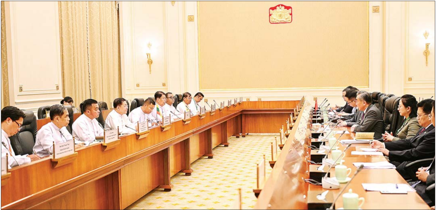
နိုင်ငံတော်စီမံအုပ်ချုပ်ရေးကောင်စီဥက္ကဋ္ဌ နိုင်ငံတော်ဝန်ကြီးချုပ် ဗိုလ်ချုပ်မှူးကြီး မင်းအောင်လှိုင် ဦးဆောင်သော အဖွဲ့နှင့် တရုတ်ကွန်မြူနစ်ပါတီဗဟိုကော်မတီ၊ နိုင်ငံရေးရာဇဝါဒီအဖွဲ့ဝင်နှင့် နိုင်ငံခြားရေးဝန်ကြီး H. E. Mr. Wang Yi ဦးဆောင်သော ကိုယ်စားလှယ်အဖွဲ့တို့ နှစ်နိုင်ငံ တွေ့ဆုံဆွေးနွေးပွဲကျင်းပစဉ်။