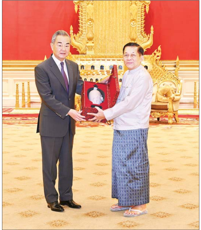
နိုင်ငံတော်စီမံအုပ်ချုပ်ရေးကောင်စီဥက္ကဋ္ဌ နိုင်ငံတော်ဝန်ကြီးချုပ် ဗိုလ်ချုပ်မှူးကြီး မင်းအောင်လှိုင်နှင့် တရုတ်ကွန်မြူနစ်ပါတီဗဟိုကော်မတီ၊ နိုင်ငံရေးရာဇဝတ်အဖွဲ့ဝင်နှင့် နိုင်ငံခြားရေးဝန်ကြီး H. E. Mr. Wang Yi တို့ အမှတ်တရလက်ဆောင်ပစ္စည်းများ အပြန်အလှန်ပေးအပ်စဉ်။