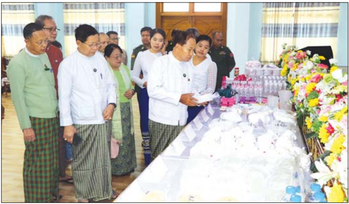
နည်းပညာသင်တန်းသည်လည်း အလုပ်အကိုင် အခွင့်အလမ်းများ ရရှိနိုင်သည့်အတွက် သင်တန်းသူ များအနေဖြင့် စာတွေ့၊ လက်တွေ့သင်ကြားနိုင်သည့် အခွင့်အရေးများရရှိမည်ဖြစ်သည့်အတွက် တန်ဖိုး ရှိသည့် သင်တန်းတစ်ခုဖြစ်ကြောင်းနှင့် ယခု သင်တန်းမှ သင်ကြားပေးမည့် ပညာရပ်များဖြင့် အလုပ်အကိုင်အခွင့်အလမ်းရရှိပြီး အောင်မြင်သည့် လူမှုစီးပွားဘဝများ တည်ဆောက်နိုင်ကြပါစေ

ခုံရွာ ဩဂုတ် ၁၄ စစ်ကိုင်းတိုင်းဒေသကြီး ကလေးအလုပ်သမား ပပျောက်ရေးဆိုင်ရာ အလုပ်အကိုင်အခွင့်အလမ်း များ ဖန်တီးပေးရေးကော်မတီက ဖွင့်လှစ်သည့် လူသုံး ကုန်ထုတ်လုပ်မှု နည်းပညာသင်တန်းအမှတ်စဉ် (၂/၀၂၄) ဖွင့်ပွဲအခမ်းအနားကို ဩဂုတ် ၁၃ ရက်က တိုင်းဒေသကြီး အစိုးရအဖွဲ့ရုံးဝင်းအတွင်းရှိ ချင်းတွင်း ခန်းမ၌ ကျင်းပရာ အခမ်းအနားသို့ တိုင်းဒေသကြီး ဝန်ကြီးချုပ် ဦးမြတ်ကျော်၊ တိုင်းဒေသကြီး တရား ညကြီးချုပ် တိုင်းဒေသကြီးအစိုးရအဖွဲ့ဝင်များ၊ တိုင်းဒေသကြီး၊ ခရိုင်၊ မြို့နယ်အဆင့်ဌာနဆိုင်ရာ များ၊ သင်တန်းနည်းပြများနှင့် သင်တန်းသူများ တက်ရောက်ကြသည်။