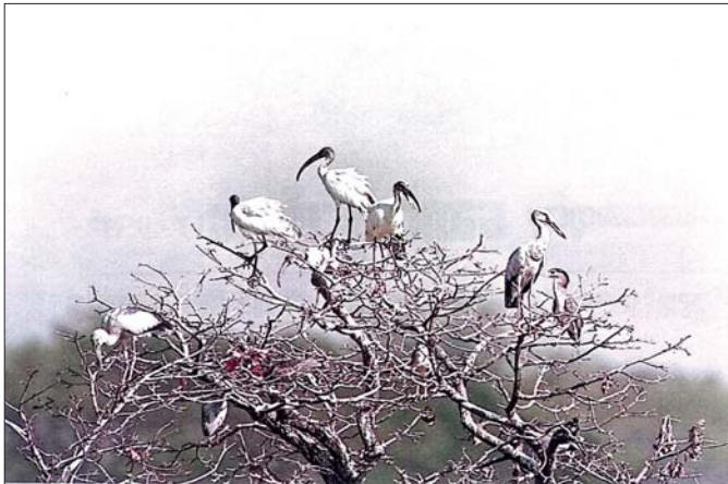
ပလိပ်အင်းအတွင်းမှ ဆောင်းခိုငှက်များနှင့် ဒေသရင်းရေနေငှက်များ

ပလိပ်အင်းအတွင်းမှ တောငန်းအုပ်စု ဆောင်းခိုငှက်များ၏ ဘဝရပ်တည်ရှင်သန်နိုင်