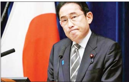
လစ်ဘရယ်ဒီမိုကရက်တစ်ပါတီအတွင်း လုပ်ဆောင်လျက်ရှိပြီး ပါတီ ၏ အထွေထွေအတွင်းရေးမှူးချုပ်ဟောင်း အိရိဘာရီဂါရုက ယင်း တာဝန်ကို ထမ်းဆောင်ရန် ဆန္ဒရှိကြောင်း အရိပ်အမြွက်ပြောကြား ထားသည်။ အင်နီအိတ်ချီကေ

တိုကျို၊ ဩဂုတ် ၁၄ ဂျပန်ဝန်ကြီးချုပ် ဖူဆီယို ကိရိဒါသည် လာမည့်လတွင် လစ်ဘရယ် ဒီမိုကရက်တစ်ပါတီ၏ ခေါင်းဆောင်ရွေးကောက်ပွဲကို ဝင်ရောက် ယှဉ်ပြိုင်သွားမည်မဟုတ်ကြောင်း ၎င်း၏ဆုံးဖြတ်ချက်ကို ထုတ်ပြန် ကြေညာလိုက်သည်။ ထို့ကြောင့် ဂျပန်နိုင်ငံတွင် ဝန်ကြီးချုပ်သစ်တစ်ဦး မကြာမီ ပေါ်ထွက်လာတော့မည် ဖြစ်သည်။ ဝန်ကြီးချုပ် ကိရိဒါသည် ဗုဒ္ဓဟူးနေ့က သတင်းစာရှင်းလင်းပွဲတွင် ၎င်း၏ ဆုံးဖြတ်ချက်ကို ထုတ်ဖော်ပြောကြား ခဲ့ခြင်းဖြစ်သည်။ ၎င်း၏ လက်ထက်တွင် ကလေးမွေးဖွားမှုနှုန်း ကျဆင်းမှုကို ကိုင်တွယ်ဖြေရှင်းရန် အကြိုးစား အစီအမံများကို အကောင် အထည်ဖော်ခဲ့ကြောင်းနှင့် ဂျပန်နိုင်ငံ၏ ကာကွယ်ရေးစွမ်းရည်ကို အားကောင်းလာစေရန် သိသိသာသာ လုပ်ဆောင်ခဲ့ကြောင်း ကိရိဒါက ပြောသည်။ နောက်ထပ်ခေါင်းဆောင်သစ် ရှာဖွေရေးနှင့်ပတ်သက်ပြီး