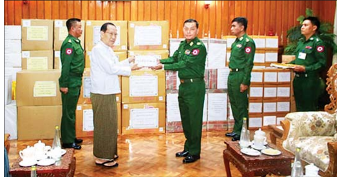
ပြည်ထောင်စု ရွေးကောက်ပွဲကော်မရှင်ဥက္ကဋ္ဌ ဦးကိုကို လုံခြုံရေးတပ်ဖွဲ့ဝင်များအတွက် ဂုဏ်ပြုချီးမြှင့်ငွေနှင့်စားသောက်ဖွယ်ရာများကို တိုင်းမှူးထံ ဂုဏ်ပြုပေးအပ်စဉ်။

ငါးဆယ်နှင့် ငွေကျပ်နှစ်ဆယ်နှစ် သိန်းတန်ဖိုးရှိ စားသောက်ဖွယ်ရာများကိုလည်းကောင်း၊ နယ်စပ်ရေးရာဝန်ကြီးဌာနမှ ဝန်ထမ်းမိသားစုများက ငွေကျပ်သိန်းတစ်ရာနှင့် ငွေကျပ်သိန်း သုံးရာတန်ဖိုးရှိ စားသောက်ဖွယ်ရာများကိုလည်းကောင်း၊ စွမ်းအင်ဝန်ကြီးဌာနမှ ဝန်ထမ်းမိသားစုများက ငွေကျပ် လေးရာငါးသိန်းကျော် တန်ဖိုးရှိ စားသောက်ဖွယ်ရာများကိုလည်းကောင်း၊ ပြည်ထောင်စုရာထူးဝန်အဖွဲ့မှ ဝန်ထမ်းမိသားစုများနှင့် နိုင်ငံဝန်ထမ်းတာဝန်သို့