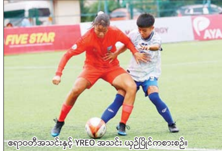
ဧရာဝတီအသင်းနှင့် YREO အသင်း ယှဉ်ပြိုင်ကစားစဉ်။

ရန်ကုန် ဩဂုတ် ၁၄ ၂၀၂၄ ရာသီ မြန်မာအမျိုးသမီးလိင်ပြိုင်ပွဲ ပွဲစဉ်(၁၃) နောက်ဆုံးနေ့ကို ဩဂုတ် ၁၄ ရက်က YUSC ကွင်း၌ ဆက်လက်ကျင်းပရာ ဧရာဝတီအသင်းက YREO အသင်းကို ခြောက်ဂိုးပြတ်အနိုင်ရခဲ့သည်။ ဧရာဝတီအမျိုးသမီးအသင်းသည် YREO အသင်းကို ဂိုးဒါဇင်ဝက်သွင်းယူကာ ဂိုးပြတ်နိုင်ပွဲစာမျက်နှာ ၁၁ ကော်လံ ၁