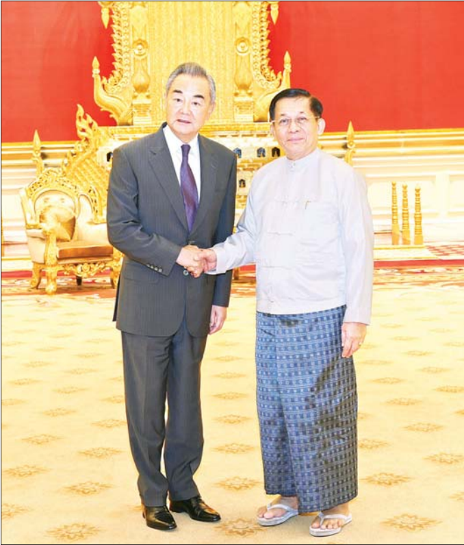
နိုင်ငံတော်စီမံအုပ်ချုပ်ရေးကောင်စီဥက္ကဋ္ဌ နိုင်ငံတော်ဝန်ကြီးချုပ် ဗိုလ်ချုပ်မှူးကြီး မင်းအောင်လှိုင် တရုတ်ကွန်မြူနစ်ပါတီဗဟိုကော်မတီ၊ နိုင်ငံရေးရာဇဝတ်အဖွဲ့ဝင်နှင့် နိုင်ငံခြားရေးဝန်ကြီး H. E. Mr. Wang Yi အား ရင်းရင်းနှီးနှီးနှုတ်ဆက်စဉ်။