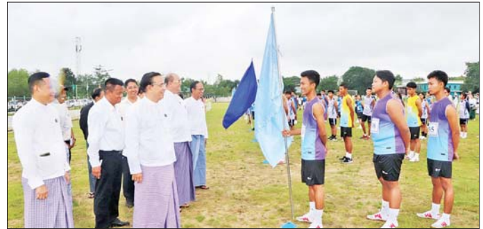
ပင်ဝင်ကာ ပွဲစဉ်ပေါင်း ၄၀၊ ပဲခူးတိုင်းဒေသကြီး ၁၄၄ ဦးတို့ဖြင့် ဩဂုတ် ၁၄ ရက်မှ ၁၅ ရက်အထိ အတွင်းရှိ ခရိုင်ခြောက်ခုနှင့် တက္ကသိုလ်၊ ကောလိပ် ကျင်းပသွားမည်ဖြစ်ကြောင်း သိရသည်။ များမှ ပြိုင်ပွဲဝင်အသင်း ၁၁ သင်း၊ အားကစားသမား တိုင်းဒေသကြီး(ပြန်/ဆက်)

ယင်းနောက် ပြိုင်ပွဲဝင်အားကစားသမားများက အားကစားသစ္စာအမိဋ္ဌာန် လေးချက်အား ရွတ်ဆိုကြသည်။ ယင်းနောက် အမှတ်(၃)အခြေခံပညာအထက်တန်းကျောင်းမှ ဘင်ခရာနှင့် ပန်းဖွားအဖွဲ့တို့က သရုပ်ပြတီးခတ်ကပြဖျော်ဖြေကြရာ တိုင်းဒေသကြီးဝန်ကြီးချုပ်က ဂုဏ်ပြုချီးမြှင့်ပေးပေးသည်။ ဆက်လက်၍ ပဲခူးတိုင်းဒေသကြီး ဝန်ကြီးချုပ်နှင့် အဖွဲ့များ၊ ကျောင်းသား ကျောင်းသူများနှင့် ဒေသခံပြည်သူများ၊ အားကစားဝါသနာရှင်များက အမျိုးသား၊ အမျိုးသမီး ဗီတာ ၁၀၀ အပြေးပြိုင်ပွဲ ယှဉ်ပြိုင်နေမှုအား ကြည့်ရှုအားပေးသည်။