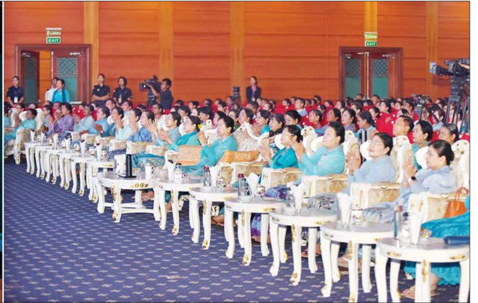
နိုင်ငံတော်စီမံအုပ်ချုပ်ရေးကောင်စီဥက္ကဋ္ဌ နိုင်ငံတော်ဝန်ကြီးချုပ်၏ဇနီး မြန်မာနိုင်ငံအမျိုးသမီးရေးရာအဖွဲ့ချုပ် ဂုဏ်ထူးဆောင်နာယက ဒေါ်ကြူကြူလှနှင့် တက်ရောက်လာကြသူများက အနုပညာရှင်များ၏ သီဆိုကပြပျော်ဖြေတင်ဆက်မှုကို ကြည့်ရှုအားပေးစဉ်။