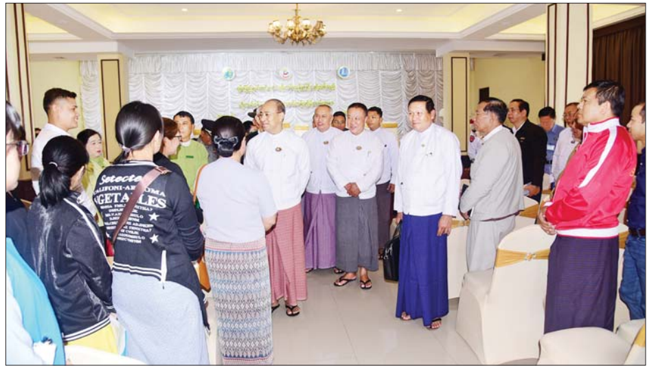
သင်တန်းများကို ဇူလိုင် ၁ ရက်မှ ၂၆ ရက်အထိ သင်တန်းသူ စုစုပေါင်း ၁၂၃ ဦး တက်ရောက်လျက်ရှိ ဖွင့်လှစ်သင်ကြားပို့ချသွားမည်ဖြစ်ပြီး သင်တန်းသား ကြောင်း သိရသည်။ ပြည်နယ်(ပြန်/ဆက်)

ဦးစီးဌာန ရှမ်းပြည်နယ်ညွှန်ကြားရေးမှူး ဦးထင်အောင်နိုင်က သင်တန်းဖွင့်လှစ်ခြင်းနှင့် ပတ်သက်၍ ရှင်းလင်းတင်ပြသည်။ အခမ်းအနားအပြီး တွင် ပြည်နယ်ဝန်ကြီးချုပ်၊ ဧည့်သည်များနှင့် သင်တန်းသား သင်တန်းသူများ စုပေါင်းမှတ်တမ်း တင် ဓာတ်ပုံရိုက်ကူးကြပြီး ပြည်နယ်ဝန်ကြီးချုပ် က ဟိုတယ်လုပ်ငန်းရှင်များ၊ သင်တန်းနည်းပြများနှင့် သင်တန်းသား သင်တန်းသူများအား ရင်းရင်းနှီးနှီး နှုတ်ဆက်သည်။ တက်ရောက်လျက်ရှိ အဆိုပါ ဟိုတယ်ဝန်ဆောင်မှုဆိုင်ရာသင်တန်း တွင် ဟိုတယ်ဧည့်ကြိုဝန်ဆောင်မှုသင်တန်း၊ ဟိုတယ် အိပ်ခန်းဆောင်ဝန်ဆောင်မှုသင်တန်းနှင့် အစား အသောက်နှင့် အဖျော်ယမကာ ဝန်ဆောင်မှုဆိုင်ရာ