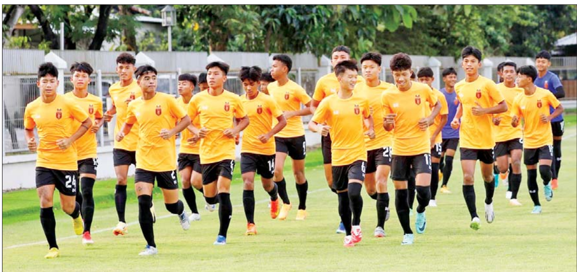
မြန်မာ ယူ-၁၆ အသင်း ကစားသမားများ လေ့ကျင့်နေမှုကို တွေ့ရစဉ်။