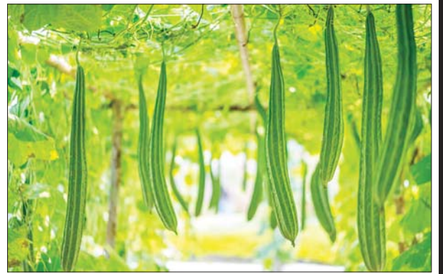
ခဲသီး စတင်ထွက်ပေါ်ချိန်မှစ၍ ရောင်းရငွေကျပ် ၁၄ သိန်းခန့် ရရှိပြီး အကျိုးအမြတ်အနေဖြင့်ငွေကျပ် ၁၀ သိန်းခန့် ရရှိကြောင်း၊ ခဲသီးကို ရာသီချိန်တွင် စိုက်ပျိုးရောင်းချခြင်းဖြင့် အကျိုးအမြတ် ပိုမိုရရှိသောကြောင့် နှစ်စဉ်စိုက်ပျိုးလျက်ရှိကြောင်း တောင်သူတစ်ဦးထံမှ သိရသည်။

ဈေးကွက်အနေဖြင့် ကုန်စိမ်းပွဲစားများမှ စိုက်ခင်းအထိ လာရောက်ဝယ်ယူ၍ ရွှေတောင်ဒေသ ဈေးကွက်အတွင်း ရောင်းချလျက်ရှိကြောင်း၊