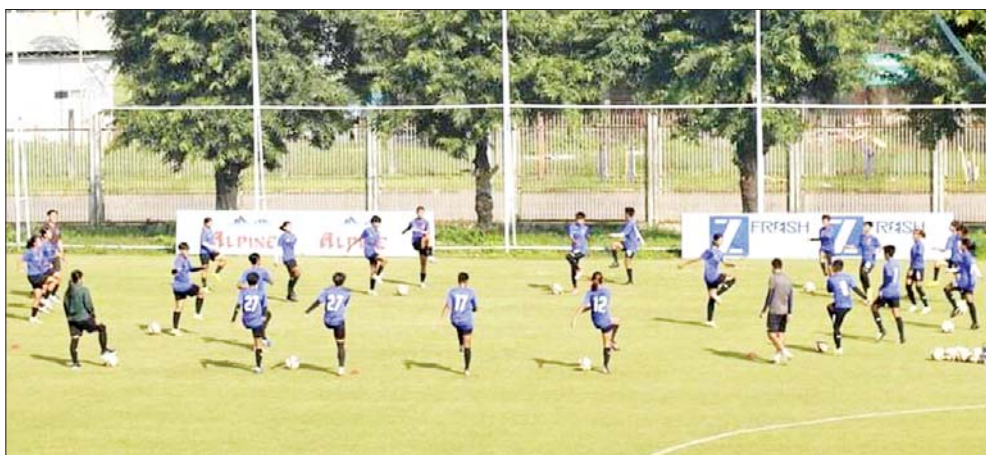
မြန်မာ့လက်ရွေးစင် အမျိုးသမီးအသင်းကစားသမားများ လေ့ကျင့်နေမှုကို တွေ့ရစဉ်။