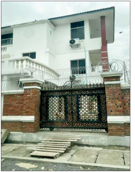
ပြည်ကြီးတံခွန်မြို့နယ် (ဃ)ရပ်ကွက်၌ တရားမဝင် အွန်လိုင်းလောင်းကစားလုပ်ကိုင်နေသူများအား သက်သေခံပစ္စည်းများနှင့်အတူ ဖမ်းဆီးရမိမှု မှတ်တမ်းဓာတ်ပုံ။