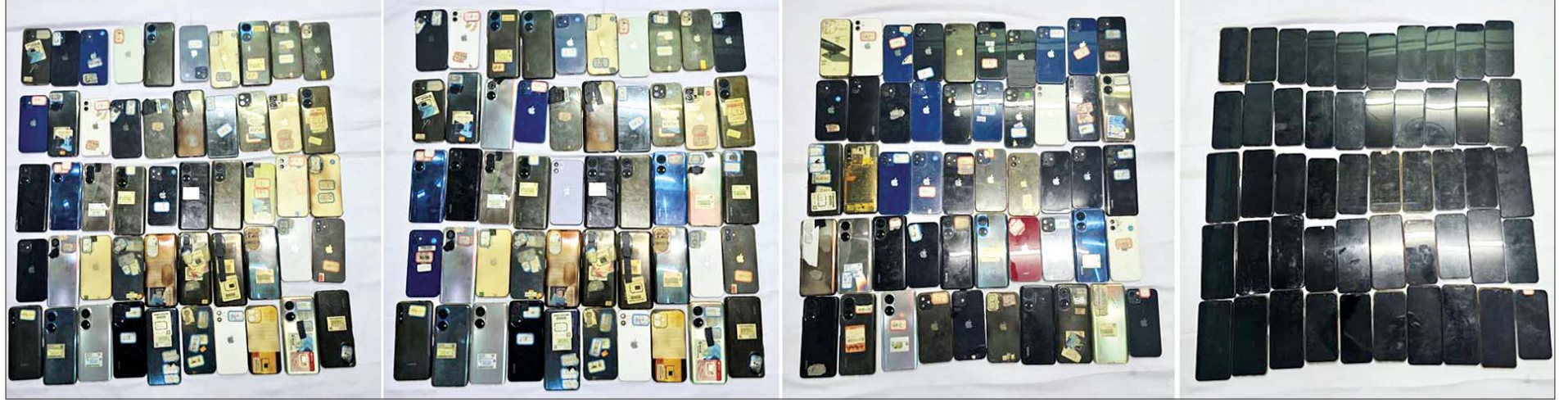
တာချီလိတ်မြို့နယ် ပါဆတ်ရပ်ကွက်၌ တရားမဝင် အွန်လိုင်းလောင်းကစားပြုလုပ်ရာတွင် အသုံးပြုသည့် သက်သေခံလက်ကိုင်ဖုန်းများအား သိမ်းဆည်းရမိမှု မှတ်တမ်းဓာတ်ပုံ။