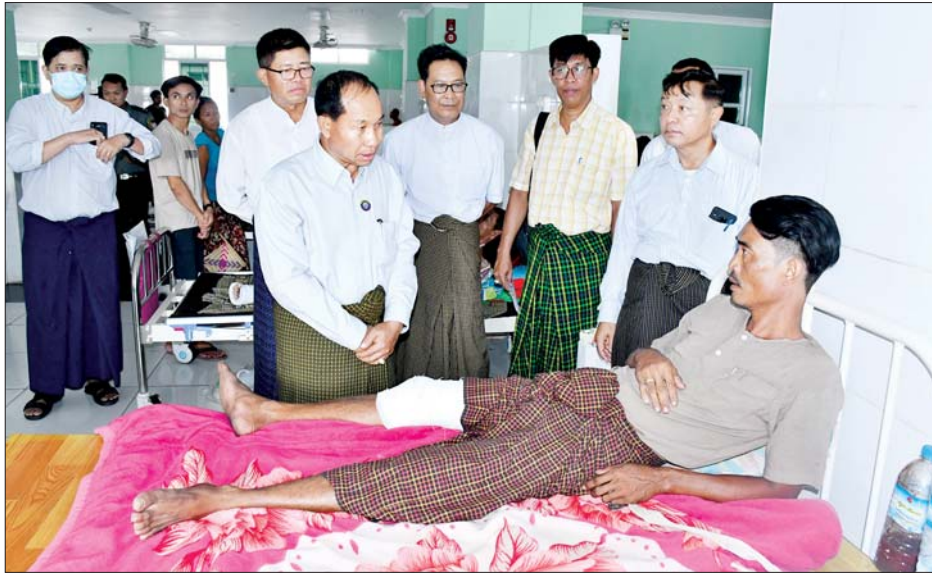
များပြောကြားကာ ထောက်ပံ့ငွေများနှင့် အာဟာရဖြည့်စည်းပေးပေးဆောင်ရွက်ပေးခဲ့သည်။ ထို့နောက် တိုင်းဒေသကြီးဝန်ကြီးချုပ်နှင့် ဇနီး၊ တိုင်းဒေသကြီး တရားသူကြီးချုပ်နှင့် ဇနီး၊ တိုင်းဒေသ

အဆိုပါ ထိခိုက်ဒဏ်ရာရရှိသူများအား တိုင်းဒေသကြီးဝန်ကြီးချုပ် ဦးမြတ်ကျော်၊ တိုင်းဒေသကြီးအစိုးရအဖွဲ့ဝင်များ၊ အနောက်မြောက်တိုင်းစစ်ဌာနချုပ်မှ တာဝန်ရှိသူများ၊ တိုင်းဒေသကြီးအဆင့် ဌာနဆိုင်ရာများ၊ မုံရွာခရိုင် / မြို့နယ်စီမံအုပ်ချုပ်ရေးအဖွဲ့ဥက္ကဋ္ဌများနှင့် တာဝန်ရှိသူများက ယမန်နေ့ မွန်းလွဲပိုင်းတွင် သွားရောက်ကြည့်ရှု အားပေးစကား