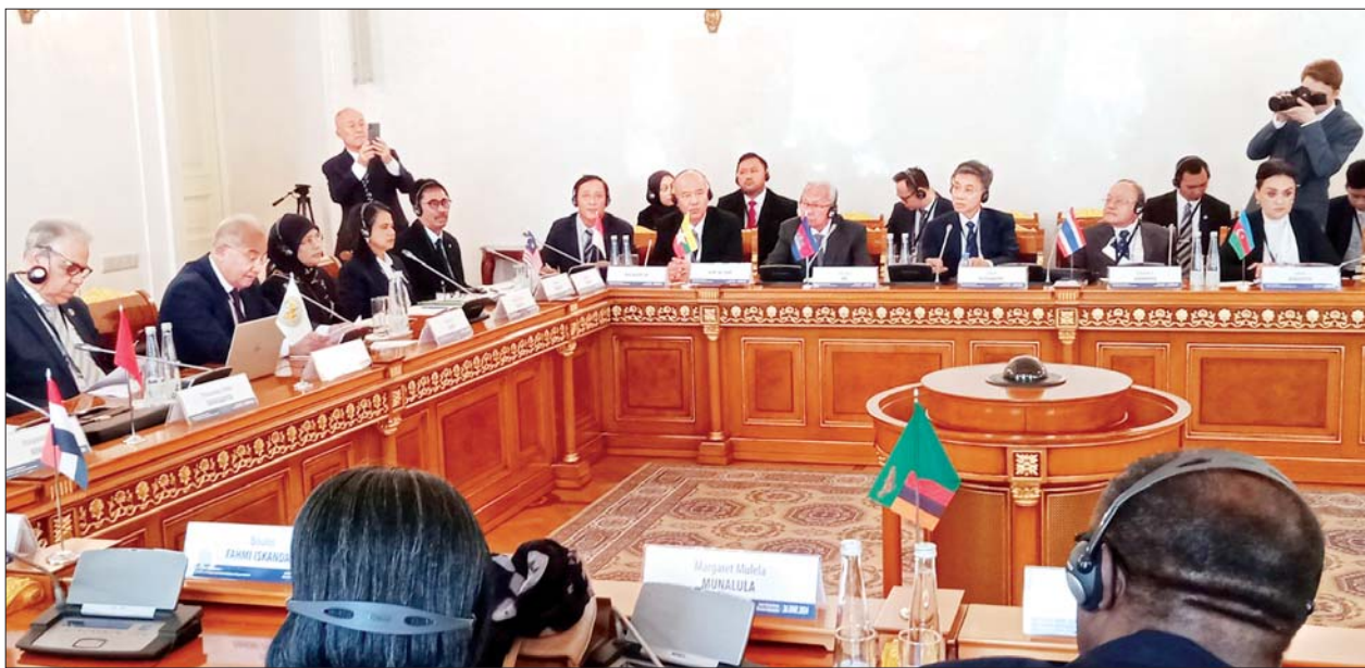
အဆိုပါ နိုင်ငံတကာညီလာခံသို့ အစည်းအဝေး (Association of Asian Constitutional Courts and Equivalent Institutions - AACC) အဖွဲ့ဝင်နိုင်ငံများရှိ ဖွဲ့စည်းပုံ အခြေခံဥပဒေဆိုင်ရာ တရားရုံးများနှင့် အဆင့်တူအဖွဲ့ အခြေခံဥပဒေဆိုင်ရာ တရားရုံး ဥက္ကဋ္ဌနှင့် တရားသူကြီးချုပ်များ၊ အခြားဖိတ်ကြားထားသော ဥပဒေ ပညာရှင်များနှင့် အပြည်ပြည် ဆိုင်ရာအဖွဲ့အစည်းများမှ အကြီး အကဲများ တက်ရောက်ခဲ့ကြပြီး ဖွဲ့စည်းပုံ အခြေခံဥပဒေဆိုင်ရာ အခွင့်အရေးနှင့် လွတ်လပ်ခွင့်များ

နေပြည်တော် ဇူလိုင် ၁ နိုင်ငံတော်ဖွဲ့စည်းပုံ အခြေခံ ဥပဒေဆိုင်ရာရုံးဥက္ကဋ္ဌ ဦးဆောင် ဇော်သိန်း ဦးဆောင်သော ကိုယ်စား လှယ်အဖွဲ့သည် ရုရှားဖက်ဒရေးရှင်း နိုင်ငံ ဖွဲ့စည်းပုံအခြေခံဥပဒေ ဆိုင်ရာတရားရုံးဥက္ကဋ္ဌ H.E. Mr. Valery D.Zorkin ၏ ဖိတ်ကြား ချက်အရ ရုရှားဖက်ဒရေးရှင်းနိုင်ငံ စိန့်ပီတာစဘတ်မြို့၌ “Protection of Rights and Constitutional Supervision” ခေါင်းစဉ်ဖြင့် ဇွန် ၂၆ ရက်မှ ၂၈ ရက်အထိ ကျင်းပ သည့် နိုင်ငံတကာညီလာခံ (International Conference) နှင့် (၁၂) ကြိမ်မြောက် နိုင်ငံတကာဥပဒေ ရေးရာဖိုရမ် (XII St. Petersburg International Legal Forum) သို့ တက်ရောက်ခဲ့ပြီး ယမန်နေ့ ညပိုင်း တွင် လေကြောင်းခရီးဖြင့် ရန်ကုန် မြို့သို့ ပြန်လည်ရောက်ရှိခဲ့သည်။