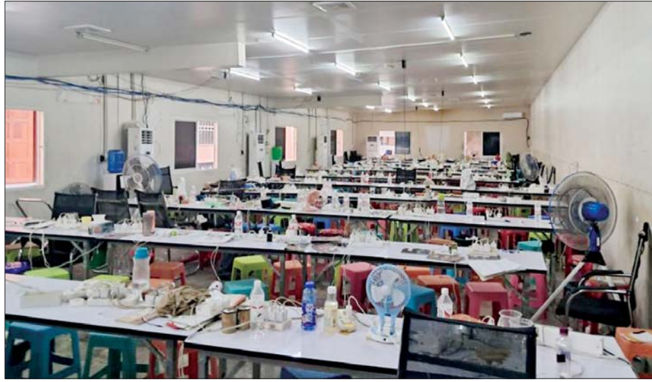
တာချီလိတ်မြို့နယ် ပါဆတ်ရပ်ကွက်၌ အထောက်အထားမဲ့ရောက်ရှိနေသည့် တရုတ်နိုင်ငံသားများ တရားမဝင် အွန်လိုင်းလောင်းကစားလုပ်ကိုင်သည့်နေရာ။