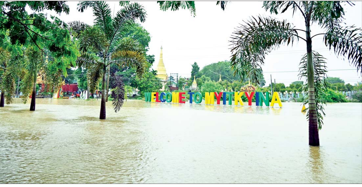
မြစ်ကြီးနားမြို့၌ ဧရာဝတီမြစ်ရေမြင့်တက်လာသဖြင့် မြို့ပေါ်ရပ်ကွက်များအတွင်း ရေများဝင်ရောက်နေမှုကို တွေ့ရစဉ်။