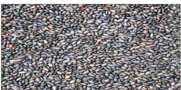
ရွှေဘိုမြို့နယ်၌ ယခုနှစ်တွင် နွေနှမ်းများ စတင်စိုက်ပျိုးချိန်တွင် မိုးရွာသွန်းမှုနည်းပါးခဲ့ပြီး ရိတ်သိမ်းချိန်တွင်လည်း ရာသီ

စစ်ကိုင်းတိုင်းဒေသကြီး ရွှေဘိုဈေးကွက်သို့ ဇွန်လပထမပတ်မှစတင်၍ နွေနှမ်း(အနက်)များ စတင်ဝင်ရောက် အရောင်းအဝယ်ဖြစ်ခဲ့ပြီး ဇွန်လတတိယပတ်အတွင်း နှမ်းနက် တင်း ၁၃၅၀၀၊ တန်အားဖြင့် ၃၃၁ တန် ဈေးကောင်းရရှိပြီး အရောင်းအဝယ်ဖြစ်ခဲ့သည်။