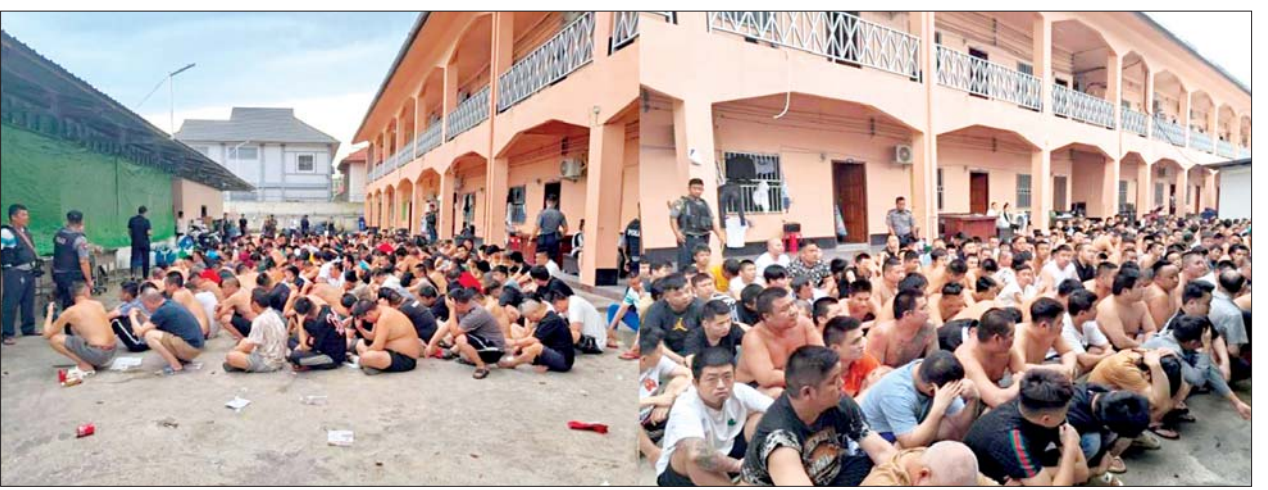
တာချီလိတ်မြို့နယ် ပါဆတ်ရပ်ကွက်၌ တရားမဝင် အွန်လိုင်းလောင်းကစားလုပ်ကိုင်နေသူ အထောက်အထားမဲ့ရောက်ရှိနေသည့် တရုတ်နိုင်ငံသားများအား ဖမ်းဆီးရမိမှု မှတ်တမ်းဓာတ်ပုံ။

(ခ)ရင်ရုံ၌ (ဘ)ဦးမကျင်အမ်းပါ အမျိုးသားတစ်ဦးနှင့် အမျိုးသမီး ရှစ်ဦး စုစုပေါင်းအိမ်ရှင်တစ်ဦးအပါအဝင် တရားမဝင် ဦးတို့ကို တရားမဝင် အွန်လိုင်းလောင်းကစား ပြုလုပ်ရာတွင် အသုံးပြုသည့် Laptop မျိုးစုံ ခြောက်လုံး၊ လက်ကိုင်ဖုန်းမျိုးစုံ ၆၃ လုံး၊ မြန်မာငွေစက္ကူငွေကျပ်သိန်း ၁၁၀၊ နိုင်ငံသားစိစစ်ရေးကတ်ပြား ခြောက်ခု၊ အခြားဆက်စပ်ပစ္စည်းများနှင့် အတူ တွေ့ရှိဖမ်းဆီးရမိခဲ့သည်။ အလားတူ ဇွန် ၂၈ ရက် ညနေ ၅ နာရီ ၄၅ မိနစ်တွင် လုံခြုံရေး