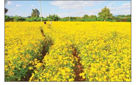
ဆောင်းပါး စာမျက်နှာ » ၆

ဆီဖူလုံမှုကို တစ်ဖက်တစ်လမ်းမှ အထောက်အကူပြုစေဖို့ ပန်းနှမ်းတိုးချဲ့ စိုက်ပျိုးကြပါစို့