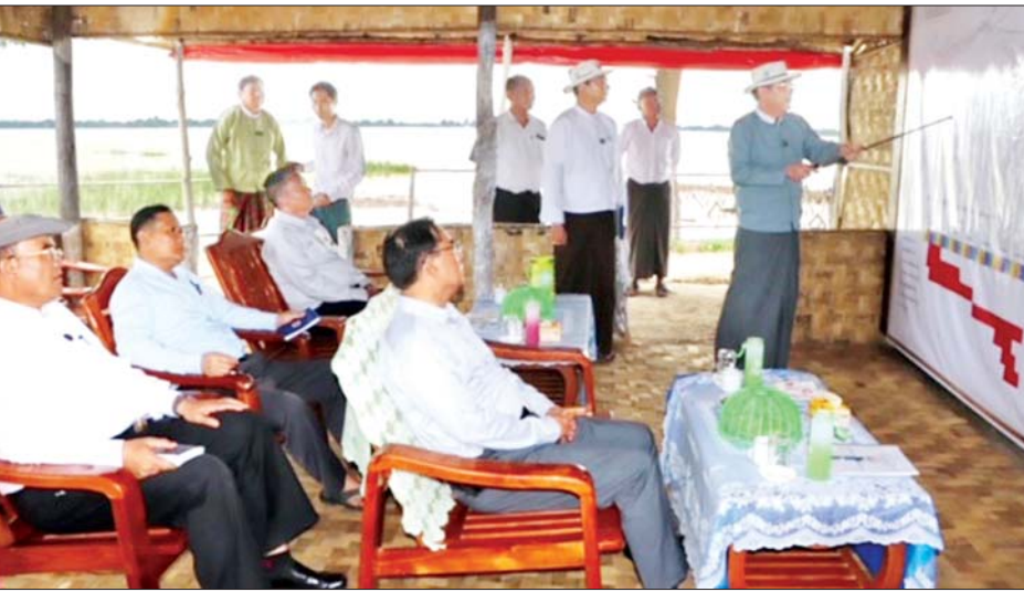
သွားရောက်၍ အုတ်ဖို-ငါးဆယ်ပေးကျေးရွာ ကျေးရွာ ချင်းဆက်လမ်း အဆင့်မြှင့်တင်ပေးနိုင်ရေး ကွင်းဆင်း ကြည့်ရှု စစ်ဆေးခဲ့ပြီး ဒေသခံတောင်သူများနှင့် တွေ့ဆုံ၍ စိုက်နည်းစနစ်၊ မျိုးကောင်းမျိုးသန့် ပြောင်းလဲစိုက်ပျိုးနိုင်ရေးနှင့် ဒေသကြက်ကို စီးပွား ဖြစ်မြှောက်နိုင်ရေး အသိပညာပေး ရှင်းလင်းပြော ကြားခဲ့သည်။

ပန်းတောင်း ဇူလိုင် ၁ ပဲခူးတိုင်းဒေသကြီး ဝန်ကြီးချုပ် ဦးမျိုးဆွေဝင်း သည် ဇွန် ၃၀ ရက်မှန်းလွဲပိုင်းက ပန်းတောင်းမြို့နယ် အတွင်း ဒေသဖွံ့ဖြိုးရေးလုပ်ငန်းများ ကွင်းဆင်းကြည့်ရှု စစ်ဆေးခဲ့သည်။