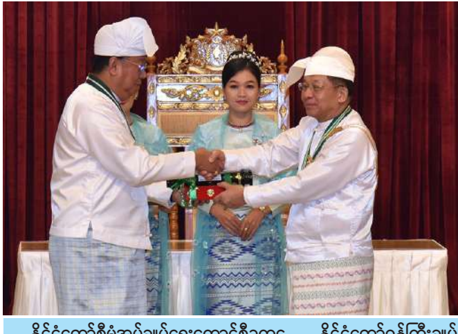
နိုင်ငံတော်စီမံအုပ်ချုပ်ရေးကောင်စီဥက္ကဋ္ဌ နိုင်ငံတော်ဝန်ကြီးချုပ် ဗိုလ်ချုပ်မှူးကြီး သတိုးမဟာသရေစည်သူ သတိုးသီရိသုဓမ္မမင်းအောင်လှိုင် စည်သူဘွဲ့ရရှိသူ ပြည်ထောင်စုအဆင့် ငြိမ်းချမ်းရေးဆွေးနွေးရေးအဖွဲ့ အဖွဲ့ ခေါင်းဆောင်(ငြိမ်း) ဦးအောင်သောင်းအတွက် ဂုဏ်ထူးဆောင်ဘွဲ့ချီးမြှင့်ရာ သား ဗိုလ်ချုပ်ကြီးမိုးအောင်က လက်ခံစဉ်။