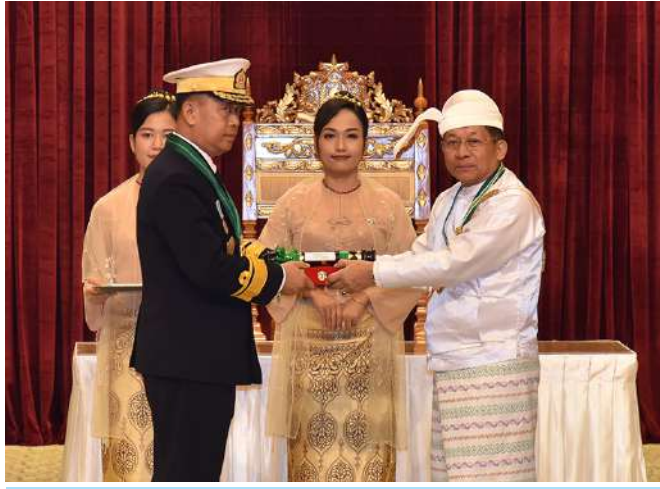
နိုင်ငံတော်စီမံအုပ်ချုပ်ရေးကောင်စီဥက္ကဋ္ဌ နိုင်ငံတော်ဝန်ကြီးချုပ် ဗိုလ်ချုပ်မှူးကြီး သတိုးမဟာသရေစည်သူ သတိုးသီရိသုဓမ္မမင်းအောင်လှိုင် ဇေယျကျော်ထင်ဘွဲ့ရရှိသည့် ကာကွယ်ရေးဝန်ကြီးဌာနမှ ဗိုလ်ချုပ်မိုးမြင့်ဆွေအား ဂုဏ်ထူးဆောင်ဘွဲ့ ချီးမြှင့်အပ်နှင်းစဉ်။