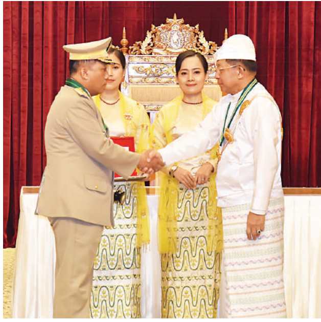
နိုင်ငံတော်စီမံအုပ်ချုပ်ရေးကောင်စီဥက္ကဋ္ဌ နိုင်ငံတော်ဝန်ကြီးချုပ် ဗိုလ်ချုပ်မှူးကြီး သတိုးမဟာသရေစည်သူ သတိုးသီရိသုဓမ္မ မင်းအောင်လှိုင် ဇေယျကျော်ထင်ဘွဲ့ရရှိသည့် ကာကွယ်ရေးဝန်ကြီးဌာနမှ ဗိုလ်ချုပ်နိုင်ဝင်းဆွေအား ဂုဏ်ထူးဆောင်ဘွဲ့ ချီးမြှင့်အပ်နှင်းစဉ်။