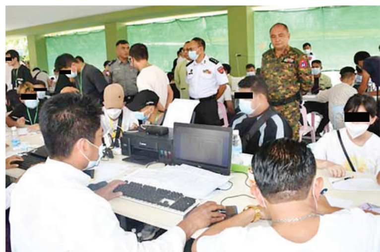
အွန်လိုင်းလိမ်လည်မှု(Telecom Fraud)နှင့် ဒုစရိုက်မူလုပ်ငန်းများတွင် ဆက်စပ်ပါဝင်ခဲ့ကြသည့် ပြည်ပနိုင်ငံသား ၁၆၃ ဦး ထပ်မံစစ်ဆေးဖော်ထုတ်ထိန်းသိမ်းနိုင်ခဲ့မှု မှတ်တမ်းဓာတ်ပုံ။ တရုတ်(တိုင်ပေ)တို့မှ နိုင်ငံသားများဖြစ် ဖြစ်ကြကြောင်း သတင်းရရှိသည်။ ကြပြီး အများစုမှာ တရုတ်နိုင်ငံသားများ (၅၀၁)