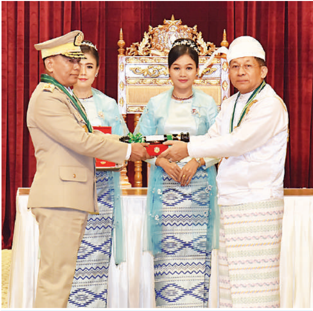
နိုင်ငံတော်စီမံအုပ်ချုပ်ရေးကောင်စီဥက္ကဋ္ဌ နိုင်ငံတော်ဝန်ကြီးချုပ် ဗိုလ်ချုပ်မှူးကြီး သတိုးမဟာသရေစည်သူ သတိုးသီရိသုဓမ္မ မင်းအောင်လှိုင် ဇေယျကျော်ထင်ဘွဲ့ရရှိသည့် ကာကွယ်ရေးဝန်ကြီးဌာနမှ ဗိုလ်ချုပ်လှမိုးအား ဂုဏ်ထူးဆောင်ဘွဲ့ ချီးမြှင့်အပ်နှင်းစဉ်။