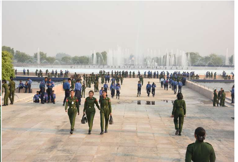
ပြည်ထောင်စုနယ်မြေနေပြည်တော်ရှိ မာရဝီဇယဗုဒ္ဓရုပ်ပွားတော်မြတ်ကြီးအပါအဝင် ဥပယုဂ်တစ်ရပ်တော်မြတ်ကြီးနှင့် အထင်ကရနေရာများကို နှစ် ၈၀ ပြည့် တပ်မတော်နေ့စစ်ရေးပြအခမ်းအနားတွင် ပါဝင်သည့် စစ်ရေးပြစစ်ကြောင်းများ သွားရောက်ဖူးမြော်လေ့လာကြစဉ်။

အား သွားရောက်ဖူးမြော်ကြည်ညိုခြင်း၊ တပ်မတော်စစ်သမိုင်းပြတိုက်နှင့် သူရဲကောင်းဗိမာန်တို့ကို သွားရောက်လေ့လာခြင်းများ ဆောင်ရွက်ခဲ့ကြသည်။ နှစ် ၈၀ ပြည့် တပ်မတော်နေ့စစ်ရေးပြ