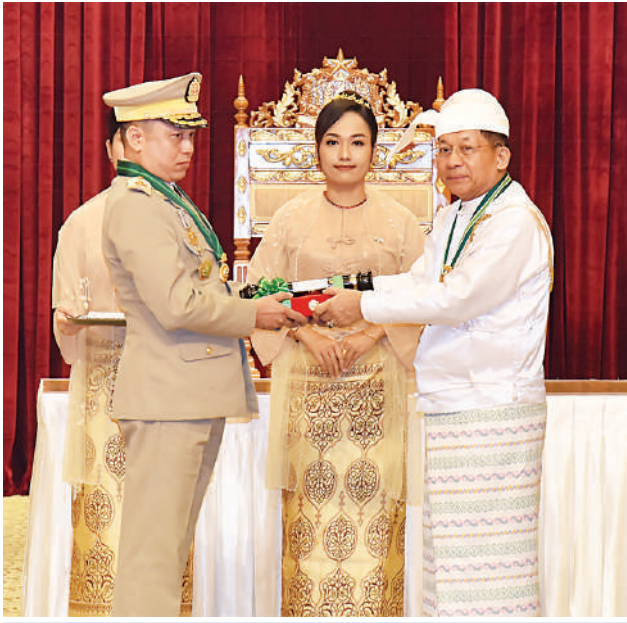
နိုင်ငံတော်စီမံအုပ်ချုပ်ရေးကောင်စီဥက္ကဋ္ဌ နိုင်ငံတော်ဝန်ကြီးချုပ် ဗိုလ်ချုပ်မှူးကြီး သတိုးမဟာသရေစည်သူ သတိုးသီရိသုဓမ္မ မင်းအောင်လှိုင် ဇေယျကျော်ထင်ဘွဲ့ရရှိသည့် ကာကွယ်ရေးဝန်ကြီးဌာနမှ ဗိုလ်ချုပ်ကျော်ကျော်ဦးအား ဂုဏ်ထူးဆောင်ဘွဲ့ ချီးမြှင့်အပ်နှင်းစဉ်။