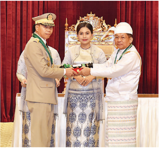
နိုင်ငံတော်စီမံအုပ်ချုပ်ရေးကောင်စီဥက္ကဋ္ဌ နိုင်ငံတော်ဝန်ကြီးချုပ် ဗိုလ်ချုပ်မှူးကြီး သတိုးမဟာသရေစည်သူ သတိုးသီရိသုဓမ္မ မင်းအောင်လှိုင် ဇေယျကျော်ထင်ဘွဲ့ရရှိသည့် ကာကွယ်ရေးဝန်ကြီးဌာနမှ ဗိုလ်ချုပ်သိန်းဇော်အား ဂုဏ်ထူးဆောင်ဘွဲ့ ချီးမြှင့်အပ်နှင်းစဉ်။