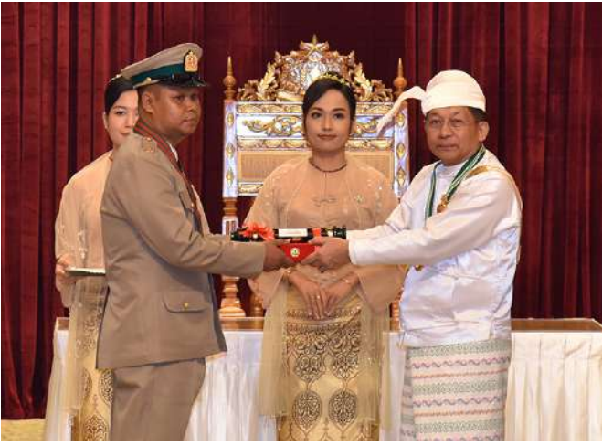
နိုင်ငံတော်စီမံအုပ်ချုပ်ရေးကောင်စီဥက္ကဋ္ဌ နိုင်ငံတော်ဝန်ကြီးချုပ် ဗိုလ်ချုပ်မှူးကြီး သတိုးမဟာသရေစည်သူ သတိုးသီရိသုဓမ္မမင်းအောင်လှိုင် သူရဲဘွဲ့ရသည့် ကာကွယ်ရေးဝန်ကြီးဌာနမှ ဗိုလ်မှူးအောင်သူအား ဂုဏ်ထူးဆောင်ဘွဲ့ ချီးမြှင့်အပ်နှင်းစဉ်။