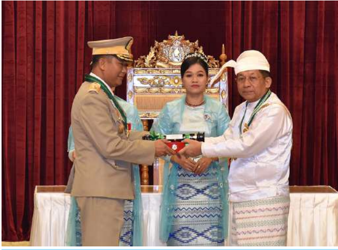
နိုင်ငံတော်စီမံအုပ်ချုပ်ရေးကောင်စီဥက္ကဋ္ဌ နိုင်ငံတော်ဝန်ကြီးချုပ် ဗိုလ်ချုပ်မှူးကြီး သတိုးမဟာသရေစည်သူ သတိုးသီရိသုဓမ္မမင်းအောင်လှိုင် ဇေယျကျော်ထင်ဘွဲ့ရရှိသည့် ကာကွယ်ရေးဝန်ကြီးဌာနမှ ဗိုလ်ချုပ်မျိုးမင်းထွန်းအား ဂုဏ်ထူးဆောင်ဘွဲ့ ချီးမြှင့်အပ်နှင်းစဉ်။