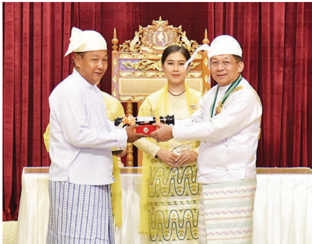
နိုင်ငံတော်စီမံအုပ်ချုပ်ရေးကောင်စီဥက္ကဋ္ဌ နိုင်ငံတော်ဝန်ကြီးချုပ် ဗိုလ်ချုပ်မှူးကြီး သတိုးမဟာသရေစည်သူ သတိုးသီရိသုဓမ္မ မင်းအောင်လှိုင် အလင်္ကာကျော်စွာဘွဲ့ရရှိသည့် အဆိုပညာရှင် ဗိုလ်မှူး ခင်မောင်လှ(ငြိမ်း)(ရဲဘော်ခင်မောင်လှ)(ကိုယ်စား) သား ဦးနိုင်ထွန်း အား ဂုဏ်ထူးဆောင်ဘွဲ့ ချီးမြှင့်အပ်နှင်းစဉ်။

စာမျက်နှာ ၁၈ မှအဆက် မိမိတို့၏သားစဉ်မြေးဆက်များကိုပါ ယခု ကဲ့သို့ကြိုးပမ်းဆောင်ရွက်စေရန် စံနမူနာ ကောင်းများပြုကြပါဟု တိုက်တွန်း မှာကြားလိုကြောင်းဖြင့် ပြောကြားသည်။ ယင်းနောက် နိုင်ငံတော်စီမံအုပ်ချုပ်ရေး ကောင်စီဥက္ကဋ္ဌ နိုင်ငံတော်ဝန်ကြီးချုပ် ဗိုလ်ချုပ်မှူးကြီး သတိုးမဟာသရေစည်သူ သတိုးသီရိသုဓမ္မ မင်းအောင်လှိုင်က ပြည်ထောင်စု စည်သူသင်္ဂဟဘွဲ့များဖြစ် ကြသည့် စည်သူဘွဲ့ရရှိသူ ၁၃ ဦး၊ တပ်မတော်စွမ်းရည်သတ္တိဆိုင်ရာ ဘွဲ့များ ဖြစ်ကြသည့် သူရဘွဲ့ရရှိသူ သုံးဦး၊ စွမ်းဆောင်မှုဆိုင်ရာ ဂုဏ်ထူးဆောင်ဘွဲ့