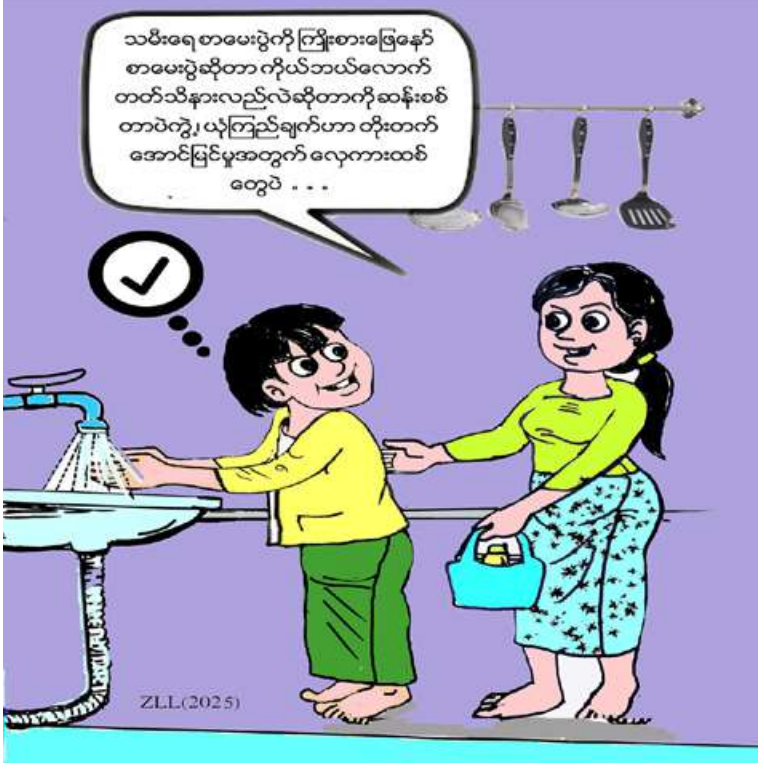
သမီးရေစာမေးပွဲကို ကြိုးစားဖြေနေတဲ့ စာမေးပွဲဆိုတာ ကိုယ်ဘယ်လောက် တတ်သိနားလည်လဲဆိုတာကို ဆန်းစစ်တာပဲကွဲ့။ ယုံကြည်ချက်ဟာ တိုးတက်အောင်မြင်မှုအတွက် လေ့ကျင့်ထမ်းတွေပဲ ...