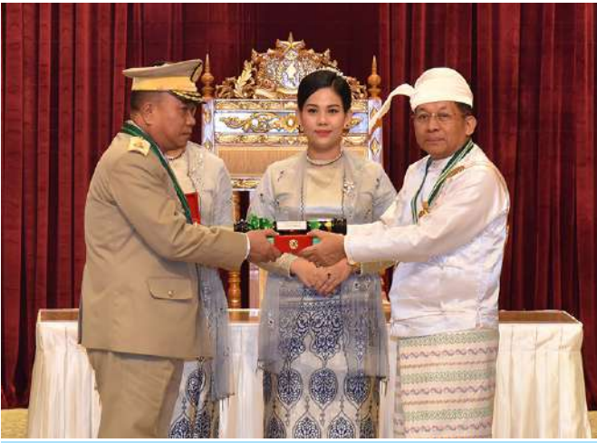
နိုင်ငံတော်စီမံအုပ်ချုပ်ရေးကောင်စီဥက္ကဋ္ဌ နိုင်ငံတော်ဝန်ကြီးချုပ် ဗိုလ်ချုပ်မှူးကြီး သတိုးမဟာသရေစည်သူ သတိုးသီရိသုဓမ္မမင်းအောင်လှိုင် ဇေယျကျော်ထင်ဘွဲ့ရရှိသည့် ကာကွယ်ရေးဝန်ကြီးဌာနမှ ဗိုလ်ချုပ်ကျော်ရွှေကျော်အား ဂုဏ်ထူးဆောင်ဘွဲ့ ချီးမြှင့်အပ်နှင်းစဉ်။