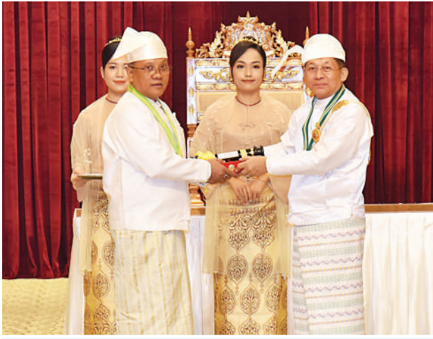
နိုင်ငံတော်စီမံအုပ်ချုပ်ရေးကောင်စီဥက္ကဋ္ဌ နိုင်ငံတော်ဝန်ကြီးချုပ် ဗိုလ်ချုပ်မှူးကြီး သတိုးမဟာသရေစည်သူ သတိုးသီရိသုဓမ္မ မင်းအောင်လှိုင် ဝဏ္ဏကျော်ထင်ဘွဲ့ရရှိသည့် ပြည်ထောင်စုရောဂါကင်းရှင်းရေး ဌာနမှ သံအမတ်ကြီး(ငြိမ်း) ဦးခိုင်ထွန်းအား ဂုဏ်ထူးဆောင်ဘွဲ့ ချီးမြှင့် အပ်နှင်းစဉ်။