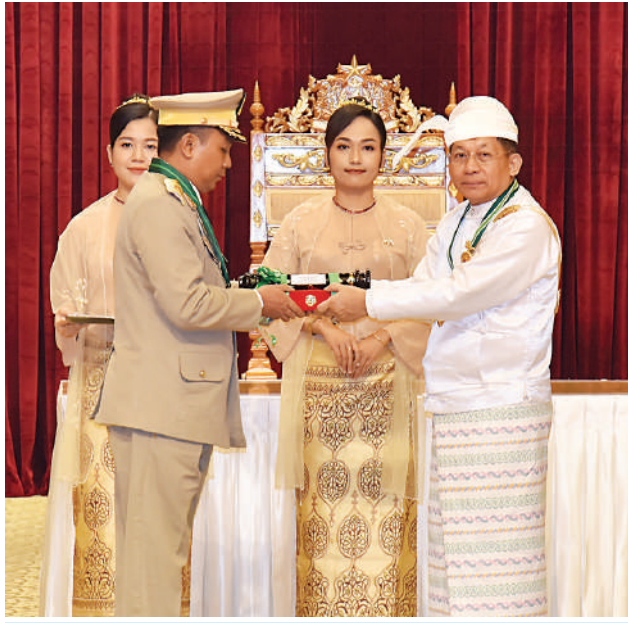
နိုင်ငံတော်စီမံအုပ်ချုပ်ရေးကောင်စီဥက္ကဋ္ဌ နိုင်ငံတော်ဝန်ကြီးချုပ် ဗိုလ်ချုပ်မှူးကြီး သတိုးမဟာသရေစည်သူ သတိုးသီရိသုဓမ္မ မင်းအောင်လှိုင် ဇေယျကျော်ထင်ဘွဲ့ရရှိသည့် ကာကွယ်ရေးဝန်ကြီးဌာနမှ ဗိုလ်ချုပ်ကျော်ကျော်လွင်အား ဂုဏ်ထူးဆောင်ဘွဲ့ ချီးမြှင့်အပ်နှင်းစဉ်။