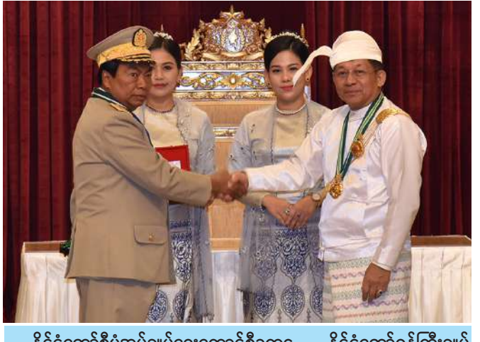
နိုင်ငံတော်စီမံအုပ်ချုပ်ရေးကောင်စီဥက္ကဋ္ဌ နိုင်ငံတော်ဝန်ကြီးချုပ် ဗိုလ်ချုပ်မှူးကြီး သတိုးမဟာသရေစည်သူ သတိုးသီရိသုဓမ္မမင်းအောင်လှိုင် စည်သူဘွဲ့ရရှိသူ ပြည်ထောင်စုငြိမ်းချမ်းရေးဆွေးနွေးမှု ပူးတွဲကော်မတီအဖွဲ့ ဝင်(ငြိမ်း) ဒုတိယဗိုလ်ချုပ်ကြီးမြင့်စိုး(ငြိမ်း)အား ဂုဏ်ထူးဆောင်ဘွဲ့ချီးမြှင့် အပ်နှင်းစဉ်။