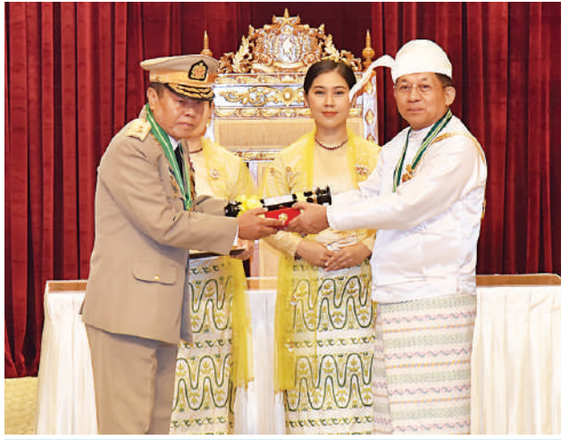
နိုင်ငံတော်စီမံအုပ်ချုပ်ရေးကောင်စီဥက္ကဋ္ဌ နိုင်ငံတော်ဝန်ကြီးချုပ် ဗိုလ်ချုပ်မှူးကြီး သတိုးမဟာသရေစည်သူ သတိုးသီရိသုဓမ္မ မင်းအောင်လှိုင် ဝဏ္ဏကျော်ထင်ဘွဲ့ရရှိသည့် ပြည်ထောင်စုရာထူးဝန်အဖွဲ့ အဖွဲ့ဝင်(ငြိမ်း) ဦးမောင်လှ (ကိုယ်စား) သား ဗိုလ်ချုပ်လှဝင်း(ငြိမ်း)အား ဂုဏ်ထူးဆောင်ဘွဲ့ ချီးမြှင့်အပ်နှင်းစဉ်။