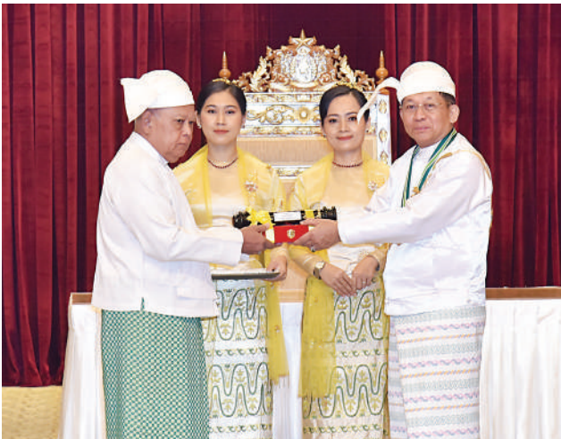
နိုင်ငံတော်စီမံအုပ်ချုပ်ရေးကောင်စီဥက္ကဋ္ဌ နိုင်ငံတော်ဝန်ကြီးချုပ် ဗိုလ်ချုပ်မှူးကြီး သတိုးမဟာသရေစည်သူ သတိုးသီရိသုဓမ္မ မင်းအောင်လှိုင် ဝဏ္ဏကျော်ထင်ဘွဲ့ရရှိသည့် နိုင်ငံခြားရေးဝန်ကြီး ဌာနမှ သံအမတ်ကြီး(ငြိမ်း) ဦးရွှေဇံအောင်(ကိုယ်စား) သား ဗိုလ်မှူး ထွန်းဇံအောင်(ငြိမ်း)အား ဂုဏ်ထူးဆောင်ဘွဲ့ ချီးမြှင့်အပ်နှင်းစဉ်။