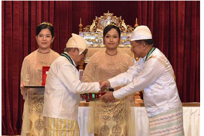
နိုင်ငံတော်စီမံအုပ်ချုပ်ရေးကောင်စီဥက္ကဋ္ဌ နိုင်ငံတော်ဝန်ကြီးချုပ် ဗိုလ်ချုပ်မှူးကြီး သတိုးမဟာသရေစည်သူ သတိုးသီရိသုဓမ္မမင်းအောင်လှိုင် စည်သူဘွဲ့ရရှိသူ သာသနာရေးနှင့်ယဉ်ကျေးမှုဝန်ကြီးဌာန မြန်မာသမိုင်း အဖွဲ့ ဒုတိယဥက္ကဋ္ဌ(၂) ဒေါက်တာတိုးလှအား ဂုဏ်ထူးဆောင်ဘွဲ့ချီးမြှင့် အပ်နှင်းစဉ်။