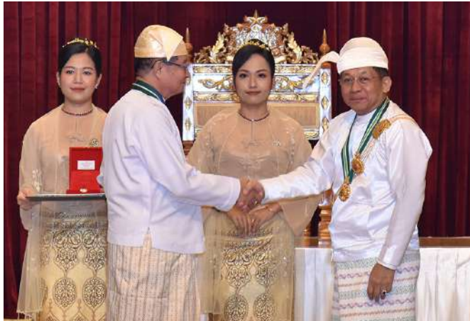
နိုင်ငံတော်စီမံအုပ်ချုပ်ရေးကောင်စီဥက္ကဋ္ဌ နိုင်ငံတော်ဝန်ကြီးချုပ် ဗိုလ်ချုပ်မှူးကြီး သတိုးမဟာသရေစည်သူ သတိုးသီရိသုဓမ္မမင်းအောင်လှိုင် စည်သူဘွဲ့ရရှိသူ ပြည်ထောင်စုငြိမ်းချမ်းရေးဖော်ဆောင်ရေးလုပ်ငန်း ကော်မတီ ဒုတိယဥက္ကဋ္ဌ(ငြိမ်း) ဦးအောင်မင်းအား ဂုဏ်ထူးဆောင်ဘွဲ့ချီးမြှင့် အပ်နှင်းစဉ်။