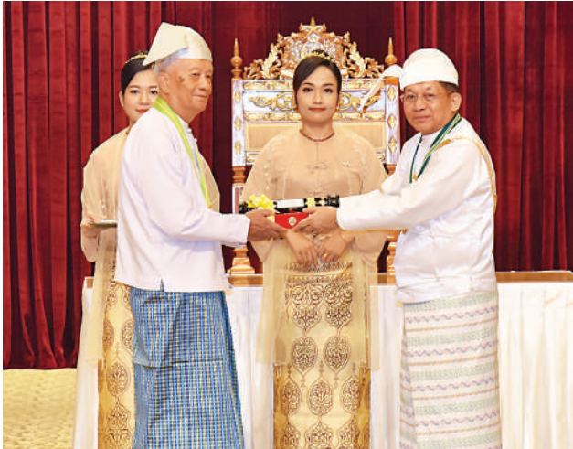
နိုင်ငံတော်စီမံအုပ်ချုပ်ရေးကောင်စီဥက္ကဋ္ဌ နိုင်ငံတော်ဝန်ကြီးချုပ် ဗိုလ်ချုပ်မှူးကြီး သတိုးမဟာသရေစည်သူ သတိုးသီရိသုဓမ္မ မင်းအောင်လှိုင် ဝဏ္ဏကျော်ထင်ဘွဲ့ရရှိသည့် နိုင်ငံခြားရေးဝန်ကြီး ဌာနမှ သံအမတ်ကြီး(ငြိမ်း) ဦးတင်ထွန်းအား ဂုဏ်ထူးဆောင်ဘွဲ့ ချီးမြှင့်အပ်နှင်းစဉ်။