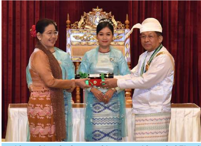
နိုင်ငံတော်စီမံအုပ်ချုပ်ရေးကောင်စီဥက္ကဋ္ဌ နိုင်ငံတော်ဝန်ကြီးချုပ် ဗိုလ်ချုပ်မှူးကြီး သတိုးမဟာသရေစည်သူ သတိုးသီရိသုဓမ္မမင်းအောင်လှိုင် စည်သူဘွဲ့ရရှိသူ စာရေးဆရာမကြီး ဒေါက်တာဒေါ်တင်ဝင်း(ဒေါက်တာ မတင်ဝင်း-ပညာရေးတက္ကသိုလ်)အတွက် ဂုဏ်ထူးဆောင်ဘွဲ့ချီးမြှင့်ရာ ဒေါ်နန့်ချစ်ကြည်က လက်ခံစဉ်။

၂၅ ရှေးဦးမှအဆက် အဆိုပါအခမ်းအနားသို့ နိုင်ငံ တော်စီမံအုပ်ချုပ်ရေးကောင်စီဥက္ကဋ္ဌ နိုင်ငံတော်ဝန်ကြီးချုပ်၏ ဇနီး ဒေါ်ကြာကြာလှ၊ နိုင်ငံတော်စီမံအုပ်ချုပ် ရေးကောင်စီဒုတိယဥက္ကဋ္ဌ ဒုတိယ ဝန်ကြီးချုပ် ဒုတိယဗိုလ်ချုပ်မှူးကြီး သီရိပျံချိ မဟာသရေစည်သူစိုးဝင်း နှင့်ဇနီး ဒေါ်သန်းသန်းနွယ်၊ ကောင်စီ အတွင်းရေးမှူးနှင့် ဇနီး၊ တွဲဖက် အတွင်းရေးမှူးနှင့် ဇနီး၊ ကောင်စီဝင် များနှင့် ဇနီးများပြည်ထောင်စုအဆင့် ပုဂ္ဂိုလ်များ၊ ပြည်ထောင်စုဝန်ကြီးများ နှင့် ဇနီးများ၊ ကာကွယ်ရေးဦးစီးချုပ်ရုံး မှ အဆင့်မြင့်တပ်မတော်အရာရှိကြီး များနှင့်ဇနီးများ၊ ဒုတိယဝန်ကြီးများ နှင့်တာဝန်ရှိသူများ၊ ဂုဏ်ထူးဆောင် ဘွဲ့ရရှိကြသည့်ပုဂ္ဂိုလ်များနှင့်မိသားစု ဝင်များ တက်ရောက်ကြသည်။ ဦးစွာ နိုင်ငံတော်စီမံအုပ်ချုပ်ရေး ကောင်စီဥက္ကဋ္ဌ နိုင်ငံတော်ဝန်ကြီးချုပ် က ဂုဏ်ပြုအမှာစကားပြောကြားရာ တွင် တည်ငြိမ်အေးချမ်းပြီး ခေတ်မီ ဖွံ့ဖြိုးတိုးတက်သည့်နိုင်ငံဖြစ်စေရန် ဘက်စုံထောင့်စုံက ကြိုးပမ်းတည် ဆောက်နေရာ၌ ပြည်ထောင်စုဖွား တိုင်းရင်းသား ပြည်သူအားလုံး၏ အင်အားသည်အဓိကကျပြီး အားလုံး ၏ပူးပေါင်းပါဝင်မှုသည် အရေးကြီး ကြောင်း၊ နိုင်ငံတော်အစိုးရ၏ ဦးဆောင်မှုနှင့်အတူ ပြည်သူတစ်ဦး ချင်းစီက စိတ်ဓာတ်၊ အသိအမြင်၊ ကာယဉာဏ စွမ်းအားများနှင့် ပူးပေါင်းပါဝင်မှု အင်အားဖြင့်သာ