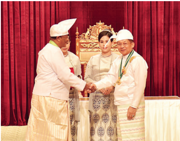
နိုင်ငံတော်စီမံအုပ်ချုပ်ရေးကောင်စီဥက္ကဋ္ဌ နိုင်ငံတော်ဝန်ကြီးချုပ် ဗိုလ်ချုပ်မှူးကြီး သတိုးမဟာသရေစည်သူ သတိုးသီရိသုဓမ္မ မင်းအောင်လှိုင် ဝဏ္ဏကျော်ထင်ဘွဲ့ရရှိသည့် ဒေါက်တာစိုးလွင်(ငြိမ်း) (ငြိမ်း)အား ဂုဏ်ထူးဆောင်ဘွဲ့ ချီးမြှင့်အပ်နှင်းစဉ်။