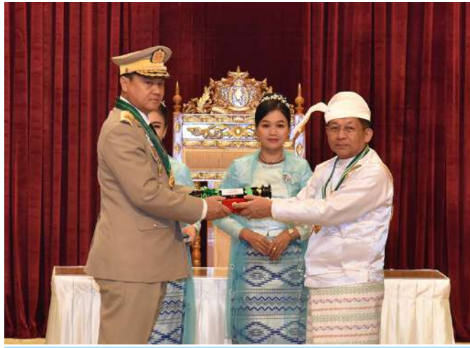
နိုင်ငံတော်စီမံအုပ်ချုပ်ရေးကောင်စီဥက္ကဋ္ဌ နိုင်ငံတော်ဝန်ကြီးချုပ် ဗိုလ်ချုပ်မှူးကြီး သတိုးမဟာသရေစည်သူ သတိုးသီရိသုဓမ္မမင်းအောင်လှိုင် ဇေယျကျော်ထင်ဘွဲ့ရရှိသည့် ကာကွယ်ရေးဝန်ကြီးဌာနမှ ဗိုလ်ချုပ်မိုးမြင့်ဆွေအား ဂုဏ်ထူးဆောင်ဘွဲ့ ချီးမြှင့်အပ်နှင်းစဉ်။

အောင်မြင်နိုင်မည်ဖြစ်ကြောင်းထိုသို့ ဂုဏ်ပြုလျက်ရှိကြောင်း။ ဆောင်ရွက်ကြရာတွင် သာမန်အဆင့် အေးချမ်းသာယာပြီးခေတ်မီဖွံ့ဖြိုး ထက်သာလွန်သည့် လုံ့လ၊ ဝီရိယ၊ တိုးတက်သည့် နိုင်ငံတော်ကိုတည် ခြောက်စွာ ဆောင်ရွက်ခဲ့ကြသည့် ဆောက်ရာတွင် စွမ်းစွမ်းတစ်ဆောင် မြောက်စွာ ဆောင်ရွက်ခဲ့ကြသည့် ရွက်ကြသည့်ပုဂ္ဂိုလ်များ၊ အမျိုးသား ပုဂ္ဂိုလ်များလည်းရှိနေသည်ကိုတွေ့ရ ရေးမှုဝါဒဖြစ်သည့် ဒို့တာဝန်အရေး သည့်အတွက် ဝမ်းသာဂုဏ်ယူမိ သုံးပါးကို ကာကွယ်စောင့်ရှောက်ရာ တွင် သက်စွန့်ကြိုးပမ်းဆောင်ရွက် ကြသည့် ပုဂ္ဂိုလ်များ၊ ရပ်ရွာအေးချမ်း နှီးဆောင်မှုနှင့်အတူ စိတ်ရော သာယာရေးနှင့် တရားဥပဒေစိုးမိုး ကိုယ်ပါနှစ်မြှုပ်ပြီး မိမိတတ်စွမ်းသမျှ တွင် နိုင်ငံတော်အစိုးရ အသိပညာ၊ အတတ်ပညာများနှင့် နိုင်ငံတော်ဖြစ်ပေါ်လာစေရေးအတွက် နိုင်ငံရေး၊စီးပွားရေး၊လူမှုရေးဦးတည် ချက်များနှင့်အညီ ထူးခြားစွာ ရေးနေနှင့်ထူးနေမြတ်အခါသမယ အားထုတ် ကြိုးပမ်းဆောင်ရွက်ကြ များတွင်ထိုက်သင့်သည့် ဂုဏ်ထူး သည့် ပုဂ္ဂိုလ်များ၊ နိုင်ငံတကာ ဆက်ဆံရေးနယ်ပယ်တွင် သံတမန် ဆက်ဆံရေးနယ်ပယ်တွင် သံတမန်