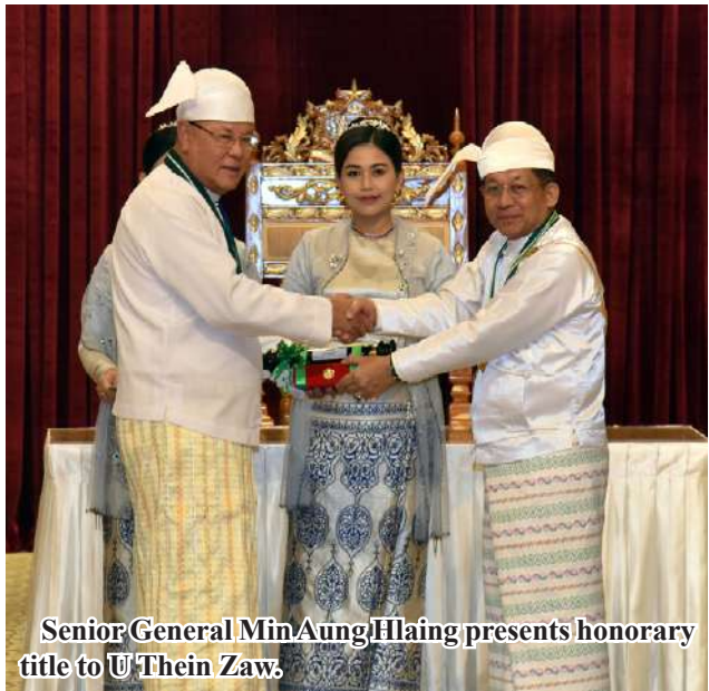
Senior General Min Aung Hlaing presents honorary title to U Thein Zaw.

The government's implementation of the Five-Point Roadmap, Nine Objectives, and Two National Goals