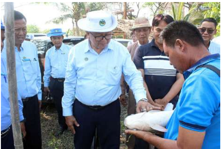
အရှေ့အလယ်ပိုင်းဒေသကြီး ငါးလုပ်ငန်းဦးစီးဌာနမှ အဖွဲ့ဝင်များသည် မွေးမြူရေးစခန်းများကို စစ်ဆေးကြည့်ရှုနေကြောင်း ဖော်ပြပုံဖြစ်သည်။ (သတင်းစဉ်)

Pre-Audit Team၏စစ်ဆေးဆောင်ရွက်ခဲ့ သည့်အချက် ၁၀၃ ချက်အတိုင်း တိတိ ကျကျ လိုက်နာဆောင်ရွက်ကြရေး ဈေးကွက်လိုအပ်ချက်အရ ဆော်ဒီအာရေ ဗျနိုင်ငံသို့ မွေးမြူရေးရေထွက်ကုန်ပစ္စည်း များ တင်ပို့ခွင့်ရရှိရေးအတွက် BAP ကျင့်စဉ်နှင့်အညီ ဆောင်ရွက်ရေးနှင့် ငါးလုပ်ငန်းဦးစီးဌာန၏ လမ်းညွှန်ချက် များကို စနစ်တကျလိုက်နာကျင့်သုံးရန် လိုအပ်ချက်များ၊ မွေးမြူသည်မှ ကုန်ချော ထုတ်လုပ်သည်ထိ လုပ်ငန်းစဉ်အဆင့် တိုင်းတွင် တင်သွင်းနိုင်ငံများက ချမှတ် ထားသည့် ဥပဒေ၊ စည်းမျဉ်းစည်းကမ်း များနှင့်အညီ ထုတ်လုပ်နိုင်ရေးနှင့်