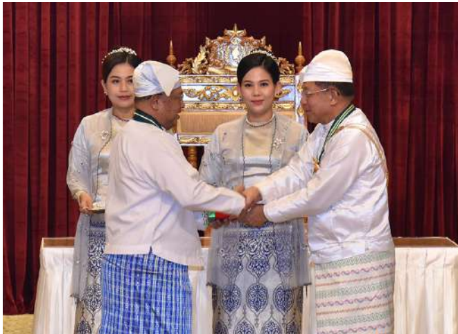
နိုင်ငံတော်စီမံအုပ်ချုပ်ရေးကောင်စီဥက္ကဋ္ဌ နိုင်ငံတော်ဝန်ကြီးချုပ် ဗိုလ်ချုပ်မှူးကြီး သတိုးမဟာသရေစည်သူ သတိုးသီရိသုဓမ္မမင်းအောင်လှိုင် စည်သူဘွဲ့ရရှိသူ နိုင်ငံတော်စီမံအုပ်ချုပ်ရေးကောင်စီအဖွဲ့ဝင် ဦးဝဏ္ဏမောင်လွင် အား ဂုဏ်ထူးဆောင်ဘွဲ့ချီးမြှင့်အပ်နှင်းစဉ်။