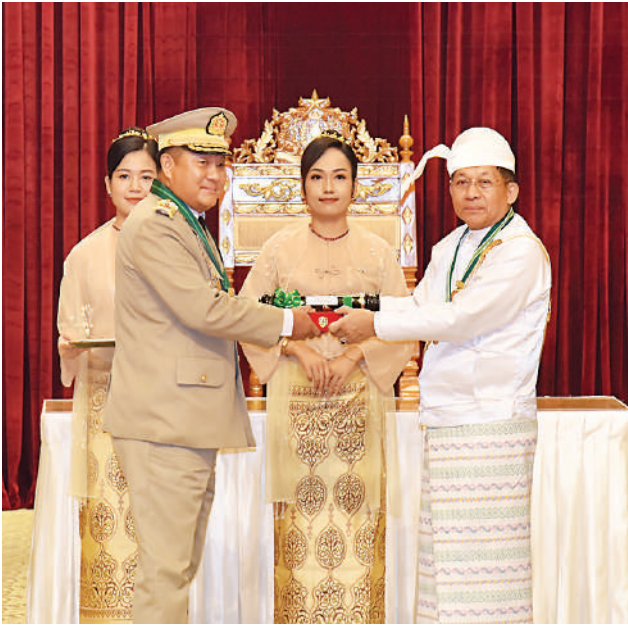
နိုင်ငံတော်စီမံအုပ်ချုပ်ရေးကောင်စီဥက္ကဋ္ဌ နိုင်ငံတော်ဝန်ကြီးချုပ် ဗိုလ်ချုပ်မှူးကြီး သတိုးမဟာသရေစည်သူ သတိုးသီရိသုဓမ္မ မင်းအောင်လှိုင် ဇေယျကျော်ထင်ဘွဲ့ရရှိသည့် ကာကွယ်ရေးဝန်ကြီးဌာနမှ ဗိုလ်ချုပ်အောင်ခင်သိန်းအား ဂုဏ်ထူးဆောင်ဘွဲ့ ချီးမြှင့်အပ်နှင်းစဉ်။