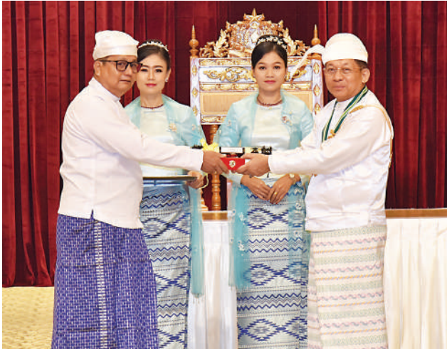
နိုင်ငံတော်စီမံအုပ်ချုပ်ရေးကောင်စီဥက္ကဋ္ဌ နိုင်ငံတော်ဝန်ကြီးချုပ် ဗိုလ်ချုပ်မှူးကြီး သတိုးမဟာသရေစည်သူ သတိုးသီရိသုဓမ္မ မင်းအောင်လှိုင် ဝဏ္ဏကျော်ထင်ဘွဲ့ရရှိသည့် နိုင်ငံခြားရေးဝန်ကြီး ဌာနမှ သံအမတ်ကြီး(ငြိမ်း) ဦးလှဆွေ(ကိုယ်စား) အမွေခံ ဦးလှမောင်ချို အား ဂုဏ်ထူးဆောင်ဘွဲ့ ချီးမြှင့်အပ်နှင်းစဉ်။