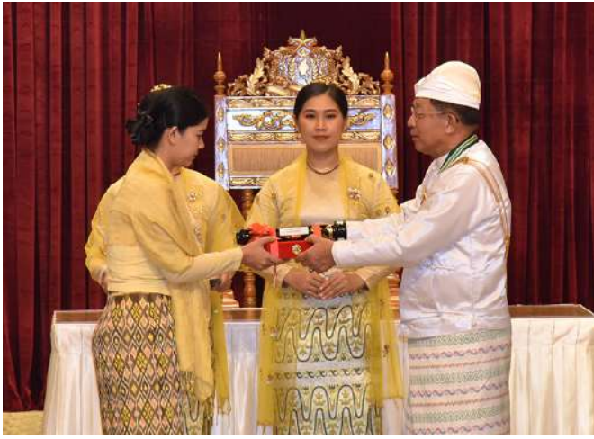
နိုင်ငံတော်စီမံအုပ်ချုပ်ရေးကောင်စီဥက္ကဋ္ဌ နိုင်ငံတော်ဝန်ကြီးချုပ် ဗိုလ်ချုပ်မှူးကြီး သတိုးမဟာသရေစည်သူ သတိုးသီရိသုဓမ္မမင်းအောင်လှိုင် သူရဲဘွဲ့ရသည့် ကာကွယ်ရေးဝန်ကြီးဌာနမှ ဗိုလ်မှူးကြီးသက်ပိုင်မြင့်(ကိုယ်စား) ဇနီး ဒေါ်နှင်းဦးလှိုင်အား ဂုဏ်ထူးဆောင်ဘွဲ့ ချီးမြှင့်အပ်နှင်းစဉ်။