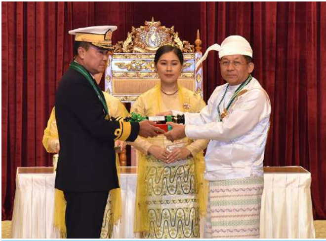
နိုင်ငံတော်စီမံအုပ်ချုပ်ရေးကောင်စီဥက္ကဋ္ဌ နိုင်ငံတော်ဝန်ကြီးချုပ် ဗိုလ်ချုပ်မှူးကြီး သတိုးမဟာသရေစည်သူ သတိုးသီရိသုဓမ္မမင်းအောင်လှိုင် ဇေယျကျော်ထင်ဘွဲ့ရရှိသည့် ကာကွယ်ရေးဝန်ကြီးဌာနမှ ဗိုလ်ချုပ်ကျော်ရွှေထွန်းအား ဂုဏ်ထူးဆောင်ဘွဲ့ ချီးမြှင့်အပ်နှင်းစဉ်။