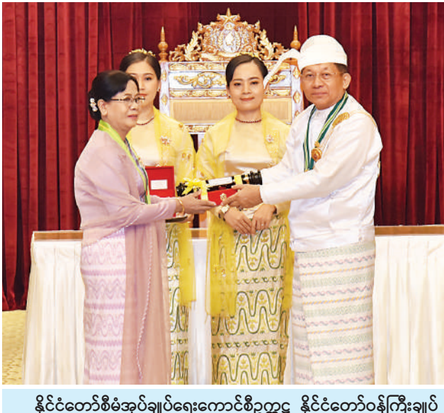
နိုင်ငံတော်စီမံအုပ်ချုပ်ရေးကောင်စီဥက္ကဋ္ဌ နိုင်ငံတော်ဝန်ကြီးချုပ် ဗိုလ်ချုပ်မှူးကြီး သတိုးမဟာသရေစည်သူ သတိုးသီရိသုဓမ္မ မင်းအောင်လှိုင် ဝဏ္ဏကျော်ထင်ဘွဲ့ရရှိသည့် စစ်ကိုင်းတိုင်းဒေသကြီး ဥပဒေချုပ်ရုံး တိုင်းဒေသကြီးဥပဒေချုပ် ဒေါ်လှလှဝင်းအား ဂုဏ်ထူးဆောင်ဘွဲ့ ချီးမြှင့်အပ်နှင်းစဉ်။