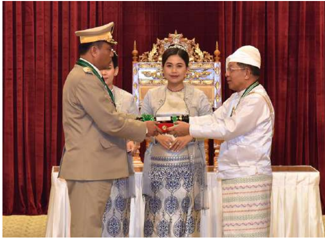
နိုင်ငံတော်စီမံအုပ်ချုပ်ရေးကောင်စီဥက္ကဋ္ဌ နိုင်ငံတော်ဝန်ကြီးချုပ် ဗိုလ်ချုပ်မှူးကြီး သတိုးမဟာသရေစည်သူ သတိုးသီရိသုဓမ္မမင်းအောင်လှိုင် ဇေယျကျော်ထင်ဘွဲ့ရရှိသည့် ကာကွယ်ရေးဝန်ကြီးဌာနမှ ဗိုလ်ချုပ်သန်းထိုက်အား ဂုဏ်ထူးဆောင်ဘွဲ့ ချီးမြှင့်အပ်နှင်းစဉ်။