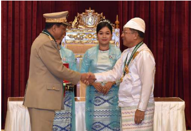
နိုင်ငံတော်စီမံအုပ်ချုပ်ရေးကောင်စီဥက္ကဋ္ဌ နိုင်ငံတော်ဝန်ကြီးချုပ် ဗိုလ်ချုပ်မှူးကြီး သတိုးမဟာသရေစည်သူ သတိုးသီရိသုဓမ္မမင်းအောင်လှိုင် စည်သူဘွဲ့ရရှိသူ ပြည်ထောင်စုအဆင့် ငြိမ်းချမ်းရေးဆွေးနွေးရေးအဖွဲ့ အဖွဲ့ဝင်(ငြိမ်း) ဒုတိယဗိုလ်ချုပ်ကြီးသက်နိုင်ဝင်း(ငြိမ်း)အား ဂုဏ်ထူးဆောင် ဘွဲ့ ချီးမြှင့်အပ်နှင်းစဉ်။