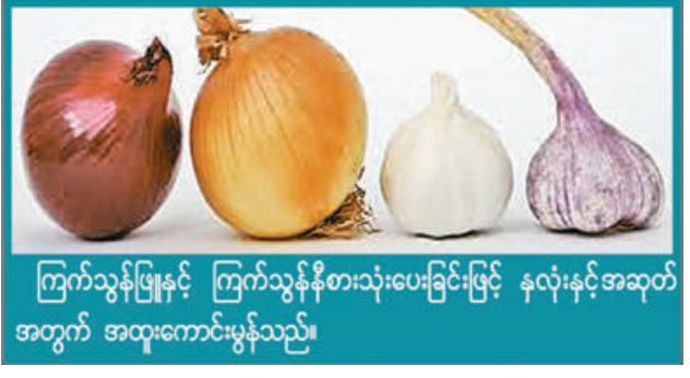
ကြက်သွန်ဖြူနှင့် ကြက်သွန်နီစားသုံးပေးခြင်းဖြင့် နှလုံးနှင့်အဆုတ် အတွက် အထူးကောင်းမွန်သည်။