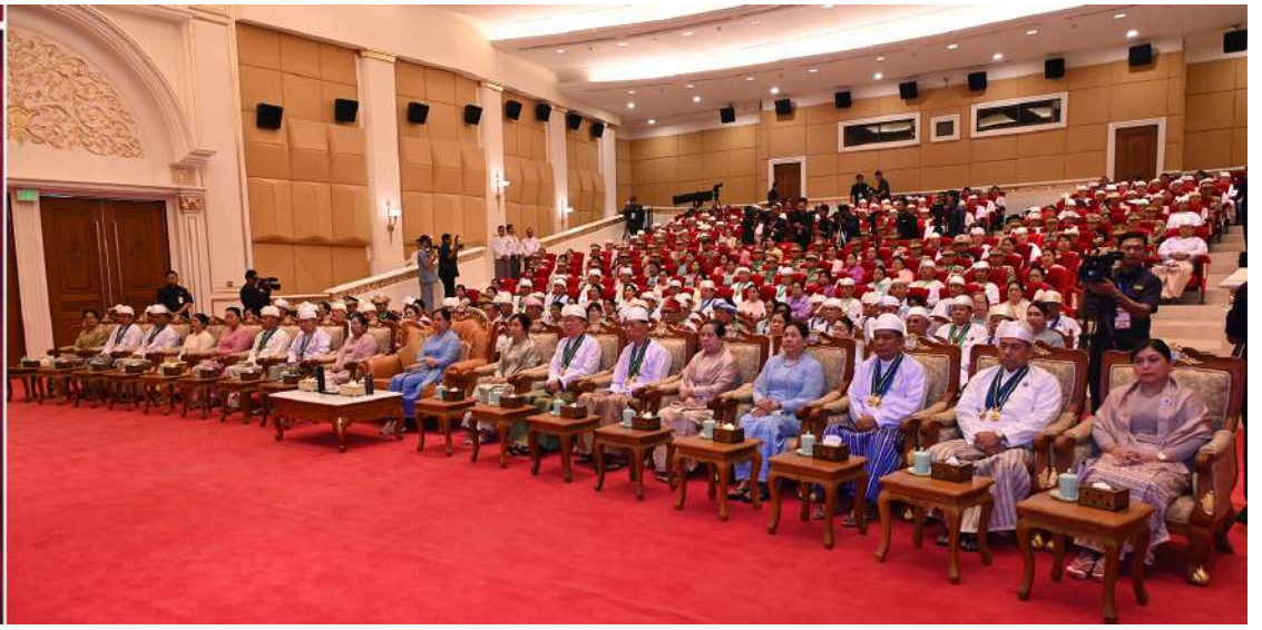
နိုင်ငံတော်စီမံအုပ်ချုပ်ရေးကောင်စီဥက္ကဋ္ဌ နိုင်ငံတော်ဝန်ကြီးချုပ် ဗိုလ်ချုပ်မှူးကြီး သတိုးမဟာသရေစည်သူ သတိုးသီရိသုဓမ္မမင်းအောင်လှိုင် ၂၀၂၅ ခုနှစ် ဂုဏ်ထူးဆောင်ဘွဲ့များ ချီးမြှင့်အပ်နှင်းခြင်းအခမ်းအနားတွင် ဂုဏ်ပြု အမှာစကားပြောကြားစဉ်။