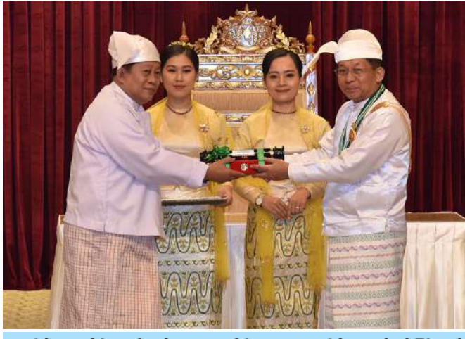
နိုင်ငံတော်စီမံအုပ်ချုပ်ရေးကောင်စီဥက္ကဋ္ဌ နိုင်ငံတော်ဝန်ကြီးချုပ် ဗိုလ်ချုပ်မှူးကြီး သတိုးမဟာသရေစည်သူ သတိုးသီရိသုဓမ္မမင်းအောင်လှိုင် စည်သူဘွဲ့ရရှိသူ ကျန်းမာရေးဝန်ကြီးဌာန ပြည်ထောင်စုဝန်ကြီး(ငြိမ်း) ဗိုလ်မှူးကြီးကြည်မောင်အတွက် ဂုဏ်ထူးဆောင်ဘွဲ့ချီးမြှင့်ရာ သား ဦးကြည်မော်က လက်ခံစဉ်။