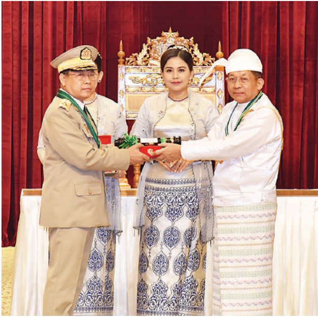
နိုင်ငံတော်စီမံအုပ်ချုပ်ရေးကောင်စီဥက္ကဋ္ဌ နိုင်ငံတော်ဝန်ကြီးချုပ် ဗိုလ်ချုပ်မှူးကြီး သတိုးမဟာသရေစည်သူ သတိုးသီရိသုဓမ္မ မင်းအောင်လှိုင် ဇေယျကျော်ထင်ဘွဲ့ရရှိသည့် ကာကွယ်ရေးဝန်ကြီးဌာနမှ ဗိုလ်ချုပ်အောင်ကျော်မိုးအား ဂုဏ်ထူးဆောင်ဘွဲ့ ချီးမြှင့်အပ်နှင်းစဉ်။