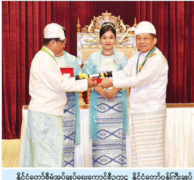
နိုင်ငံတော်စီမံအုပ်ချုပ်ရေးကောင်စီဥက္ကဋ္ဌ နိုင်ငံတော်ဝန်ကြီးချုပ် ဗိုလ်ချုပ်မှူးကြီး သတိုးမဟာသရေစည်သူ သတိုးသီရိသုဓမ္မ မင်းအောင်လှိုင် ဝဏ္ဏကျော်ထင်ဘွဲ့ရရှိသည့် နိုင်ငံတော်ဖွဲ့စည်းပုံ အခြေခံဥပဒေဆိုင်ရာခုံရုံး အမြဲတမ်းအတွင်းဝန် ဦးလှဌေးအား ဂုဏ်ထူးဆောင်ဘွဲ့ ချီးမြှင့်အပ်နှင်းစဉ်။

စာမျက်နှာ ၁၇ မှအဆက် အေးချမ်းစွာ ပညာသင်ကြားနိုင်ရေး၊ ပြည်သူများ ကိုယ်စိတ်နှလုံးအေးချမ်းစွာ နေထိုင်လုပ်ကိုင်စားသောက်နိုင်ရေး စသည့် အချက်များစွာပါဝင်သည်ကို တွေ့ရမည်ဖြစ်ကြောင်း၊ ထိုသို့ ဦးတည်ချက် လုပ်ငန်းစဉ်နှင့် ရည်မှန်းချက်တိုင်းတွင် ကဏ္ဍအလိုက် အသေးစိတ်ဖော်ဆောင်ရမည့် လုပ်ငန်းတာဝန်များစွာရှိကြောင်း၊ အားလုံး သိရှိပြီးဖြစ်သည့်အတိုင်း ပါတီစုံဒီမိုကရေစီအထွေထွေရွေးကောက်ပွဲကြီး ကျင်းပနိုင်ရန်အတွက် လိုအပ်သည့် ပြင်ဆင်မှုများကိုလည်း စီစဉ်ဆောင်ရွက်နေပြီဖြစ်ကြောင်း၊ လွတ်လပ်ပြီး တရားမျှတသည့် အထွေထွေရွေးကောက်ပွဲကို မဖြစ်မနေ ကျင်းပပြုလုပ်ပေးသွားမည်ဖြစ်သည့် အတွက် ရွေးကောက်ပွဲအောင်မြင်စွာ ကျင်းပနိုင်ရေး အစိုးရနှင့်ပြည်သူ တက်ညီလက်ညီ ဝိုင်းဝန်းပူးပေါင်းဆောင်ရွက်သွားကြရန် လိုအပ်သည်ကို ပြောကြားလိုကြောင်း။ နိုင်ငံတော်အတွက် ထူးထူးချွန်ချွန် ဆောင်ရွက်ခဲ့ကြသူများ၊ စွန့်လွှတ်စွန့်စားမှု၊ အနစ်နာခံမှုတို့ဖြင့် တာဝန်ကျေခဲ့ကြသူများကို နိုင်ငံတော်အစိုးရအနေဖြင့် ကျေးဇူးတင်ရှိပါကြောင်း၊ ကြောင်းကို ထပ်လောင်းပြောကြားလိုကြောင်း။ မိမိတို့၏ ဘဝတစ်သက်တာအတွင်း တိုင်းပြည်အတွက် ကြိုးပမ်းဆောင်ရွက်ခဲ့မှုများကို ယခုကဲ့သို့မှတ်တမ်းတင်ဂုဏ်ပြုချီးမြှင့်ခြင်းခံရသကဲ့သို့ ဆက်လက်ပြီး နိုင်ငံတော်ကြီး ရေရှည်တည်တံ့ခိုင်မြဲရေး၊ အေးချမ်းသာယာရေး၊ ခေတ်မီဖွံ့ဖြိုးတိုးတက်ရေးအတွက် စာမျက်နှာ ၁၉ သို့