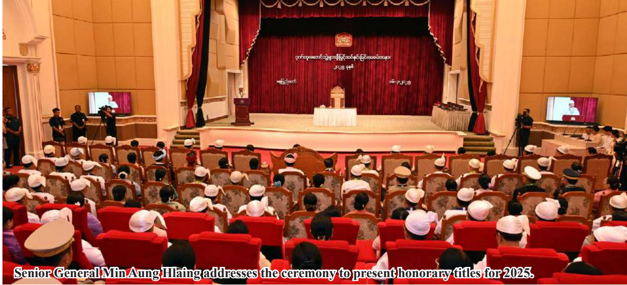
Senior General Min Aung Hlaing addresses the ceremony to present honorary titles for 2025.

Nay Pyi Taw March 16 Ceremony to present honorary titles for 2025 was held at Thabin Hall of the State Administration Council Chairman's Office this morning.