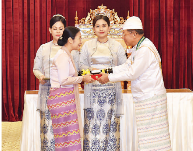
နိုင်ငံတော်စီမံအုပ်ချုပ်ရေးကောင်စီဥက္ကဋ္ဌ နိုင်ငံတော်ဝန်ကြီးချုပ် ဗိုလ်ချုပ်မှူးကြီး သတိုးမဟာသရေစည်သူ သတိုးသီရိသုဓမ္မ မင်းအောင်လှိုင် ဝဏ္ဏကျော်ထင်ဘွဲ့ရရှိသည့် နိုင်ငံခြားရေးဝန်ကြီးဌာနမှ သံအမတ်ကြီး(ငြိမ်း) ဦးဆက်(ကိုယ်စား) သမီး ဒေါ်သီတာဆက်အား ဂုဏ်ထူးဆောင်ဘွဲ့ ချီးမြှင့်အပ်နှင်းစဉ်။