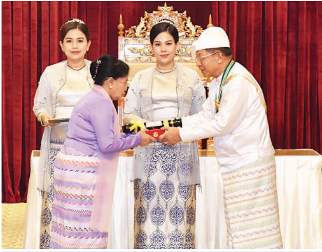
နိုင်ငံတော်စီမံအုပ်ချုပ်ရေးကောင်စီဥက္ကဋ္ဌ နိုင်ငံတော်ဝန်ကြီးချုပ် ဗိုလ်ချုပ်မှူးကြီး သတိုးမဟာသရေစည်သူ သတိုးသီရိသုဓမ္မ မင်းအောင်လှိုင် ဝဏ္ဏကျော်ထင်ဘွဲ့ရရှိသည့် နိုင်ငံတော်ဖွဲ့စည်းပုံအခြေခံ ဥပဒေဆိုင်ရာခုံရုံးအဖွဲ့ဝင်(ငြိမ်း) ဦးတင်မြင့် (ကိုယ်စား) ဇနီး ဒေါ်သန်းနု အား ဂုဏ်ထူးဆောင်ဘွဲ့ ချီးမြှင့်အပ်နှင်းစဉ်။