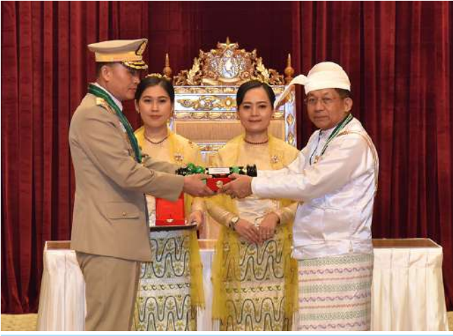
နိုင်ငံတော်စီမံအုပ်ချုပ်ရေးကောင်စီဥက္ကဋ္ဌ နိုင်ငံတော်ဝန်ကြီးချုပ် ဗိုလ်ချုပ်မှူးကြီး သတိုးမဟာသရေစည်သူ သတိုးသီရိသုဓမ္မမင်းအောင်လှိုင် ဇေယျကျော်ထင်ဘွဲ့ရရှိသည့် ကာကွယ်ရေးဝန်ကြီးဌာနမှ ဗိုလ်ချုပ်ဇော်မင်းလတ်အား ဂုဏ်ထူးဆောင်ဘွဲ့ ချီးမြှင့်အပ်နှင်းစဉ်။