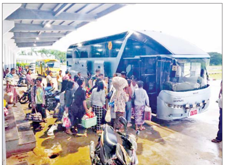
ရန်ကုန်-မန္တလေး အမှတ်(၁၁)အဆန် လူစီးအမြန်ရထားစီးခရီးသည်များအား နေပြည်တော်ဘူတာမှ မန္တလေးသို့ မော်တော်ယာဉ်များဖြင့် ပို့ဆောင်ပေးနေစဉ်။

ရေတိုက်စားနေခြင်း၊ ကလော-မြင်းဒိုက်ဘူတာအကြား ခြောက်နေရာတွင် ရထားသံလမ်းပေါ်ရေကျော်နေခြင်း၊ အောင်ပန်းဘူတာယာဒ်ဝင်းအတွင်း သံလမ်းမျက်နှာပြင်အထက် ၁၀ လက်မခန့် ရေကျော်နေခြင်းတို့ကြောင့် ယနေ့နံနက်ပိုင်းမှ စတင်၍ ရထားလမ်းပိုင်းများအား ယာယီပိတ်သိမ်းခဲ့ရသည်။ ထို့အတူ တောင်ကြီးမြို့နယ်အတွင်း စက်တင်ဘာ ၉ ရက်မှစ၍ မိုးသည်းထန်စွာရွာသွန်းမှုကြောင့် ရွှေညောင်-တောင်ကြီးလမ်းပိုင်း ထိသိမ်-ပေါမူဘူတာအကြား တောင်ကြီးမြို့သို့ ရေပေးဝေသည့် ထိသိမ်ကန်မှ ရေများ