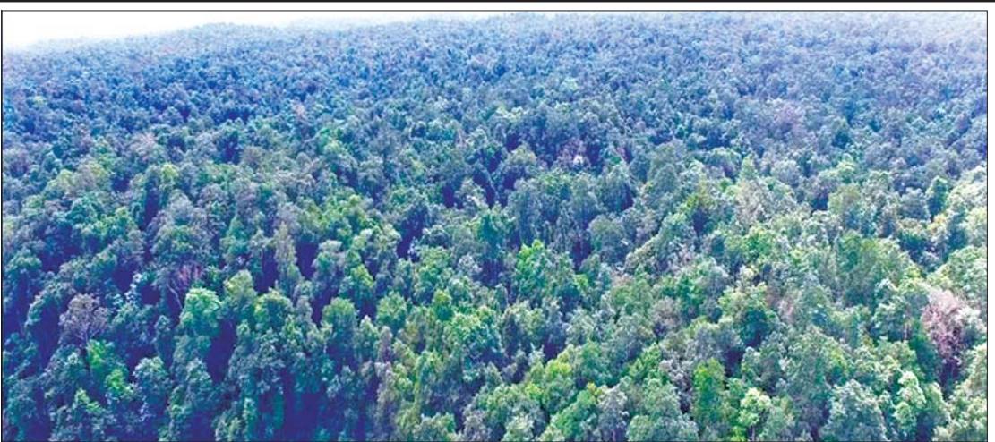
နန်းစစ်ကြီးပြင်ကာကွယ်တော၏ သဘာဝရှုခင်းပုံကို တွေ့ရစဉ်။

အန္တရာယ်စီမံခန့်ခွဲမှုစကားပိုင်းကို ဆက်လက်ကျင်းပရာ ရေဆင်းစိုက်ပျိုးရေးတက္ကသိုလ်မှ ဆရာ ဆရာမများ၊ ကျောင်းသား ကျောင်းသူများ၊ ဌာနဆိုင်ရာ ဝန်ထမ်းများက သိရှိလိုသည်များကို မေးမြန်းခြင်း၊ တာဝန်ရှိသူများက ရှင်းလင်းဖြေကြားခြင်းများ ဆောင်ရွက်ကြသည်။ ထို့နောက်ပြည်ထောင်စုဝန်ကြီးသည် နေပြည်တော်ကောင်စီဥက္ကဋ္ဌ နှင့် နေပြည်တော်ကောင်စီဝင် အဖွဲ့ဝင်များ၊ တာဝန်ရှိသူများနှင့် အတူ နေပြည်တော် တပ်ကုန်းမြို့နယ်အတွင်း မြို့ပေါ်ရပ်ကွက်များနှင့် ကျေးရွာအုပ်စု ၁၂ ခုရှိ ရေကြီးရေလျှံမြစ်ပွားနေသော နေရာဒေသများသို့ သွားရောက်၍ သက်ဆိုင်ရာ အုပ်ချုပ်ရေးအဖွဲ့အစည်းများ၊ တာဝန်ရှိသူများ၊ မြန်မာနိုင်ငံ မီးသတ်တပ်ဖွဲ့ဝင်များ၊ လူမှုကူညီရေးအသင်းအဖွဲ့များ၏ ရှာဖွေကယ်ဆယ်ရေး ဆောင်ရွက်နေမှုများကို ကွင်းဆင်း ကြည့်ရှုပြီး လိုအပ်သည်များ ဖြည့်ဆည်းပေးစေပေး ညှိနှိုင်း ဆောင်ရွက်ပေးခဲ့ကြောင်း သိရ သည်။ သတင်းစဉ်