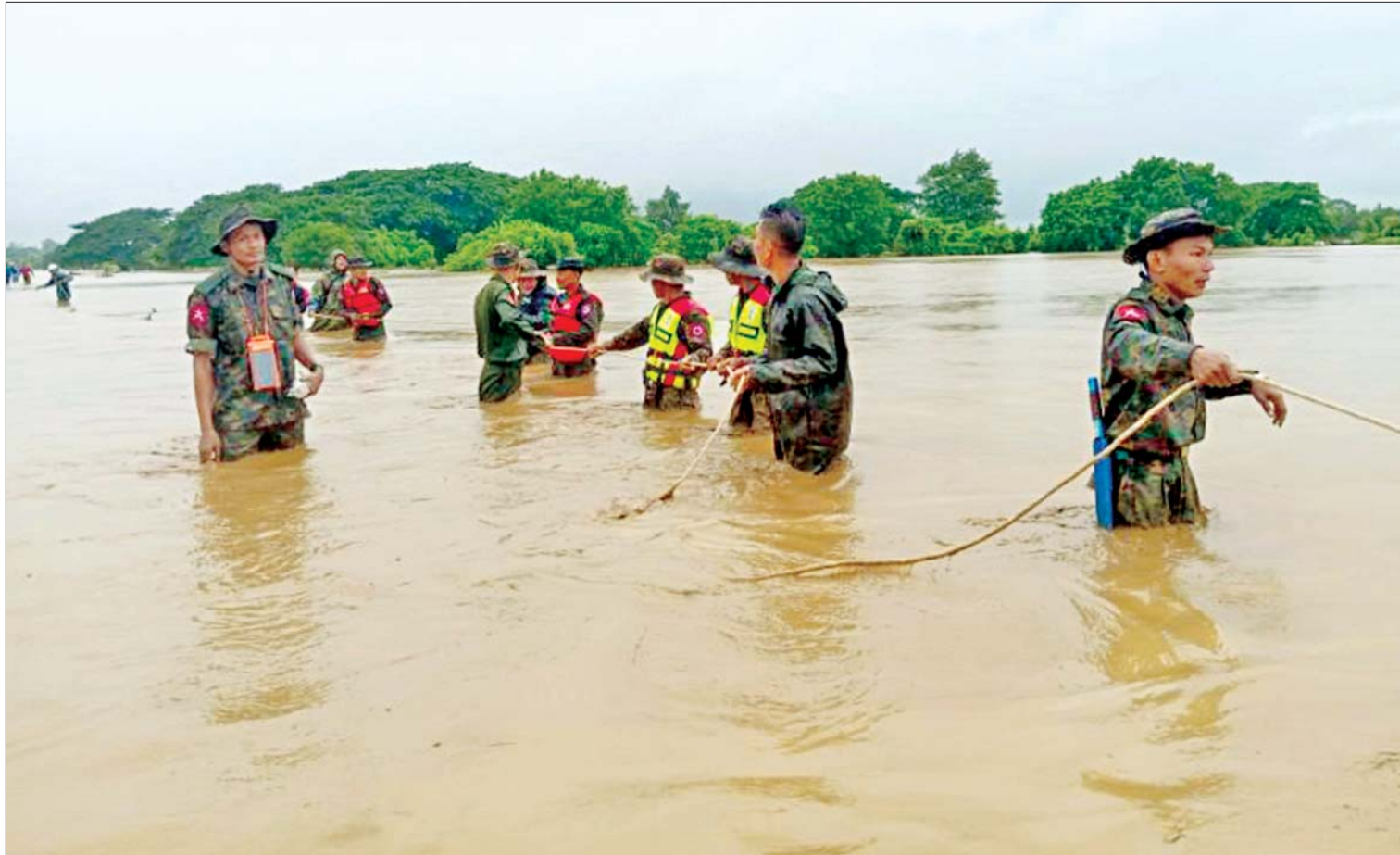
နေပြည်တော် ပုဗ္ဗသီရိမြို့နယ် ဆင်တဲကြီးရွာနှင့် ဇေယျာသီရိမြို့နယ် သိုက်ချောင်းကျေးရွာကို ဆက်သွယ်ထားသော ကွန်ကရစ်လမ်း(မြို့ပတ်လမ်း) ရေကျော်သဖြင့် နယ်မြေခံတပ်မတော်သားများက ကူညီကယ်ဆယ်ရေးလုပ်ငန်းများ ဆောင်ရွက်စဉ်။

နေပြည်တော် စက်တင်ဘာ ၁၁ တောင်တရုတ် ပင်လယ်ပြင်တွင် ဖြစ်ပေါ်ခဲ့သော တိုင်းပွန်းမုန်တိုင်း ရာဂီ၏ အရှိန်နှင့် ဘင်္ဂလားပင်လယ်အော်အနောက် အလယ်ပိုင်းနှင့် အနောက်မြောက်ပိုင်းတို့ တွင် ဖြစ်ပေါ်နေသော မုန်တိုင်းငယ်၏ အရှိန်ကြောင့် နေပြည်တော်ဝန်းကျင်၌ စက်တင်ဘာ ၈ ရက်တွင် နေရာကျကျ၊ ၉ ရက်တွင် နေရာစိပ်စိပ်၊ ၁၀ ရက်နှင့် ၁၁ ရက်တို့တွင် နေရာအနှံ့အပြား မိုးအဆက် မပြတ်ရွာသွန်းခဲ့ပြီး ယနေ့တွင် မိုးရေချိန် အနည်းဆုံး ၄ ဒသမ ၆၇ လက်မမှ အများဆုံး ၄ ဒသမ ၂၁ လက်မ အထိ ရွာသွန်းခဲ့ကာ နေပြည်တော်ကောင်စီ နယ်မြေအတွင်း ဖြတ်သန်းစီးဆင်းလျက် ရှိသည့် ငလိုက်ချောင်း၊ ဆင်သေချောင်း နှင့် ပေါင်းလောင်းမြစ်တို့တွင် ရေများ အဆက်မပြတ်မြင့်တက်လျက်ရှိသည်။ ရေကြီးရေလျှံမှုများဖြစ်ပေါ် ထိုသို့ မိုးအဆက်မပြတ်ရွာသွန်းမှုများ ကြောင့် ချောင်းရေနှင့် မြစ်ရေများ အဆက်မပြတ် မြင့်တက်လာမှုနှင့်အတူ နေပြည်တော် ကောင်စီနယ်မြေအတွင်း ရေကြီးရေလျှံမှုများ ဖြစ်ပေါ်ခဲ့ပြီး တပ်ကုန်းမြို့နယ်တွင် ယနေ့နံနက်ပိုင်းမှ စတင်၍ ရေများမြင့်တက်လာခဲ့မှုကြောင့် စာမျက်နှာ ၅ ကော်လံ ၁ သို့ *