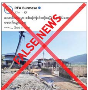
မရှိကြောင်းနှင့် PDF အမည်ခံ အကြမ်းဖက် သမားများက လောင်းလုံမြို့နယ်ရှိ ကျေးရွာအချို့

နေပြည်တော် စက်တင်ဘာ ၁၁ တနင်္လာရက်နေ့တွင် လောင်းလုံမြို့နယ်ရှိ ကျေးရွာများတွင် ပြင်ကြီးကျေးရွာတို့ကို စက်တင်ဘာ ၁၀ ရက်က လုံခြုံရေးတပ်ဖွဲ့ဝင်များ ဝင်ရောက် စီးနင်းပြီး နေအိမ် ခြောက်လုံးကို မီးရှို့ဖျက်ဆီးခြင်းနှင့် အဖိုးတန် ပစ္စည်းများကို ယူဆောင်သွားခဲ့ကြောင်း တရားမဝင်ပြည်ဖျက်မီဒီယာများက လုပ်ကြံရေးသား ဝါဒဖြန့်ဝေနေသည်ကို တွေ့ရှိရသည်။