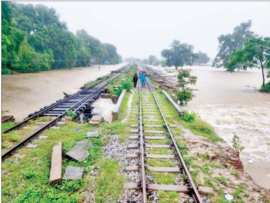
ရန်ကုန်-မန္တလေးရထားလမ်းပိုင်း ရမည်းသင်းနှင့် အင်ကျင်းကန်ဘူတာအကြား ရထားလမ်းနှင့် တံတားများရေတိုက်စားမှုကိုတွေ့ရစဉ်။