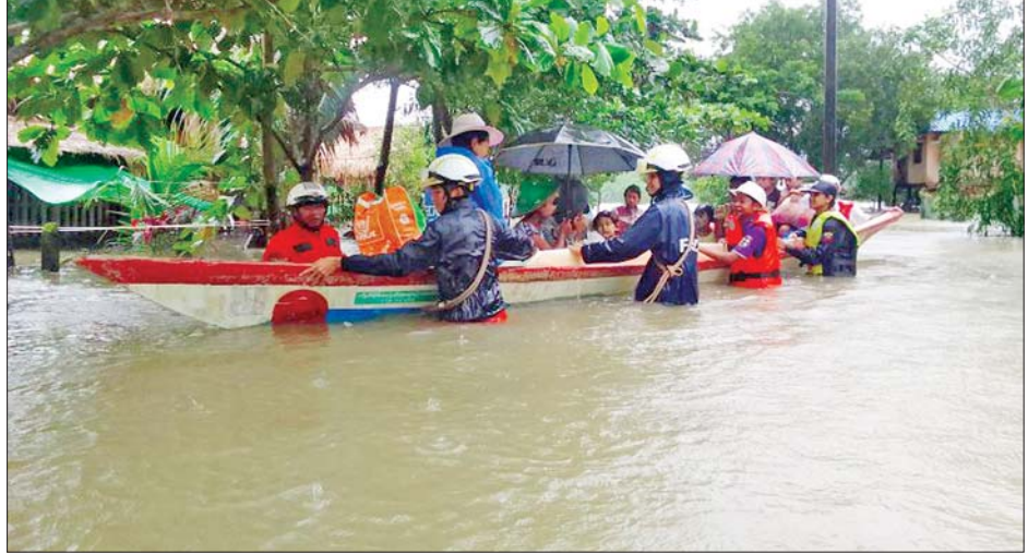
ကျိုက်ထိုမြို့နယ်၌ ရေဘေးသင့်ပြည်သူများအား ကူညီကယ်ဆယ်ရေးလုပ်ငန်းများ ဆောင်ရွက်နေစဉ်။