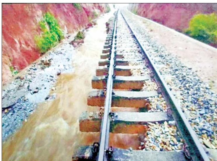
ရွှေညောင် - တောင်ကြီးလမ်းပိုင်း ထိသိမ်-ပေါမူဘူတာအကြား တာပေါင် ရေတိုက်စားမှုကိုတွေ့ရစဉ်။

မန္တလေးတိုင်းဒေသကြီးနှင့် ရှမ်းပြည်နယ်အတွင်း မိုးများအဆက်မပြတ်ရွာသွန်းမှုကြောင့် ရန်ကုန်-မန္တလေး ရထားလမ်းပိုင်းအတွင်း သာစည်မြို့နယ် ရှမ်းရွာဘူတာယာဒ်ဝင်းနှင့် ရှမ်းရွာ-ပျော်ဘွယ်လမ်းပိုင်းအတွင်း ခုနစ်နေရာ တို့တွင် သံလမ်းပေါ်ရေကျော်ခြင်းနှင့် ရထားလမ်းတာပေါင် ထူးပေါက်ခြင်း၊ ရှမ်းရွာနှင့် ရမည်းသင်းဘူတာအကြား ရှစ်နေရာတို့၌ ရထားလမ်း ရေတိုက်စားခြင်း၊ တံတားအမှတ်(၅၁၅) အဆန်လမ်း စွန်းခဲနေရာ ရေတိုက်စားခြင်း၊ တံတားအမှတ် (၅၂၉)ဒေါက်တိုင်ပြတ်ထွက်ခြင်းနှင့် မန္တလေးဘက်ခြမ်းတံတားရေတိုက်စားခြင်း၊ တပ်ကုန်း-မကျည်းပင်ဘူတာအကြား၊ မကျည်းပင်-ညောင်လွန်ဘူတာအကြားနှင့် ညောင်လွန်ဘူတာ ယာဒ်ဝင်းအတွင်း ရထားလမ်းပေါ် ရေကျော်နေခြင်း၊ ရမည်းသင်း-အင်ကြင်းကန်ဘူတာအကြား ရထားလမ်းတာပေါင် ထူးပေါက်ခြင်းတို့အပြင် ဝမ်းတွင်းမြို့နယ် သပြေတောင်း-သဲတောဘူတာအကြား တံတား