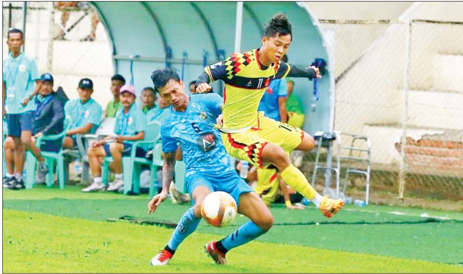
ရာမညယူနိုက်တက်အသင်းနှင့် ဧရာဝတီရိန်းဂျားအသင်းတို့ ယှဉ်ပြိုင်ကစားကြစဉ်။