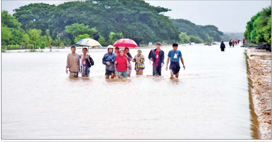
ပြည်ထောင်စုနယ်မြေ နေပြည်တော်၌ မိုးအဆက်မပြတ်ရွာသွန်းမှုကြောင့် လမ်းများပေါ်တွင် ရေကျော်လျက်ရှိသည်ကို တွေ့ရစဉ်။

ထန်စွာရွာသွန်းမှုကြောင့် ကော့ ထင်းကျေးရွာအုပ်စု၊ ရန်ကုန်- မော်လမြိုင်သွားကားလမ်း ရေ ကျော်မှုဖြစ်ပွားခဲ့သည်။ အဆိုပါ ကားလမ်း ရေကျော်နေမှုကြောင့် ယာဉ်များ ပုံမှန်သွားလာနိုင်ရေး၊ ပိတ်ဆို့မှုမဖြစ်ပေါ်စေရေး၊ လမ်း ကြောင်းရှင်းလင်းရေးနှင့် ရေလမ်း ကြောင်းပြသရန်အတွက် ဌာန ဆိုင်ရာ အဖွဲ့အစည်းများနှင့် ပရဟိတအဖွဲ့များက ပူးပေါင်း ဆောင်ရွက်လျက်ရှိကြောင်း သိရ သည်။ ထို့အတူ မွန်ပြည်နယ် ကျိုက်ထိုမြို့နယ်တွင် စက်တင်ဘာ ၇ ရက်မှ စတင်ပြီး မိုးသည်း ထန်စွာရွာသွန်း၍ တောင်ကျရေ များ စီးဆင်းလာမှုကြောင့် ကဒတ် ချောင်းရေ မြင့်တက်လာကာ