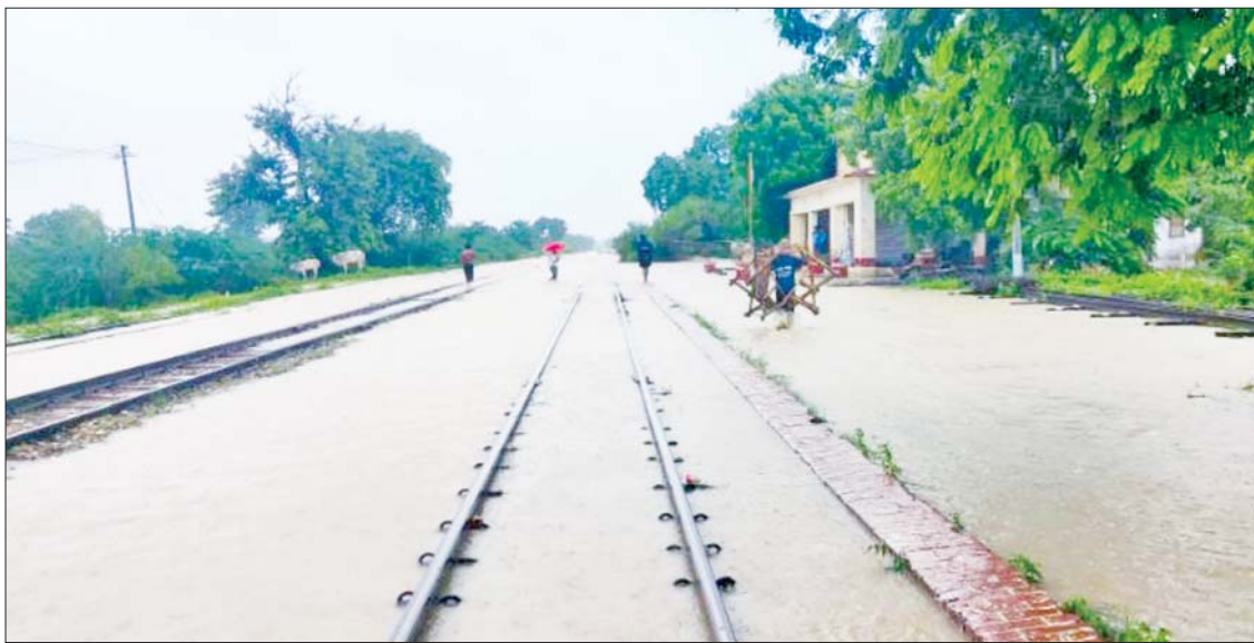
ရန်ကုန် - မန္တလေးရထားလမ်းပိုင်း ရွှေဒါး- ပျော်ဘွယ်ဘူတာအကြားနှင့် ပျော်ဘွယ်ဘူတာရထားလမ်း ရေကျော်မှုကိုတွေ့ရစဉ်။