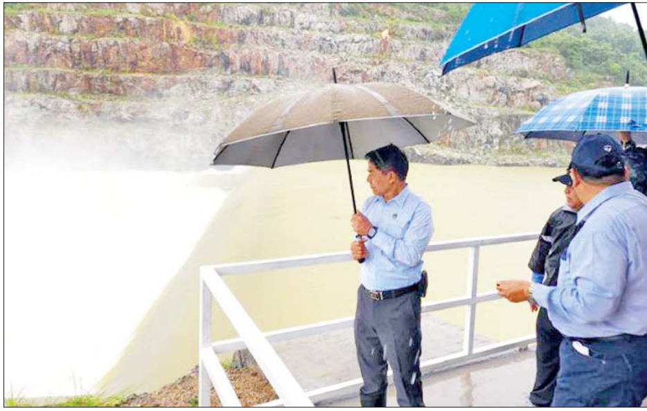
ပြည်ထောင်စုဝန်ကြီး ဦးမင်းနောင် ပေါင်းလောင်းရေလျှောက်တံအား ကြည့်ရှုစစ်ဆေးစဉ်။

နေပြည်တော် စက်တင်ဘာ ၁၁ စိုက်ပျိုးရေး၊ မွေးမြူရေးနှင့် ဆည်မြောင်း ဝန်ကြီးဌာန ပြည်ထောင်စုဝန်ကြီး ဦးမင်းနောင်သည် ဆည်မြောင်းနှင့်ရေအသုံးချမှုစီမံခန့်ခွဲရေးဦးစီးဌာန ညွှန်ကြားရေးမှူးချုပ်နှင့် တာဝန်ရှိသူများနှင့်အတူ ပြည်ထောင်စုနယ်မြေ နေပြည်တော်ရှိ ရေဆင်းနှင့် ပေါင်းလောင်းရေလျှောက်တံများ၊ ပင်လောင်းလမ်း ဆုံနေရာ၊ ဆင်သေချောင်းနှင့် ငလိုက်ချောင်းများသို့ သွားရောက်၍ မိုးသည်းထန်စွာ ရွာသွန်းမှုကြောင့် ရေဝင်ရောက်မှုများဖြစ်ပေါ်နေမှုကို ထိန်းသိမ်းစီမံ ဆောင်ရွက်နေမှု၊ တံတား၏ကြံ့ခိုင်မှုအခြေအနေ စောင့်ကြည့်စီမံမှုနှင့် ချောင်းများ၏ ရေစီးဆင်းမှု အခြေအနေတို့ကို ကွင်းဆင်းကြည့်ရှုစစ်ဆေးပြီး ချောင်းမြေတက်လာမှုကြောင့် ချောင်းဖျော့အတွင်းနှင့် အနိမ့်ပိုင်းနေရာများတွင် ရေဝင်ရောက် မှုများရှိနိုင်ပါက ကြိုတင်အသိပေး ကြေညာမှုများ ဆောင်ရွက်ရန်၊ ကူညီကယ်ဆယ်ရေးလုပ်ငန်းများကို ဆက်စပ်ဌာနအဖွဲ့အစည်းများနှင့် ပူးပေါင်းဆောင်ရွက် ရန်တို့ကို တာဝန်ရှိသူများအား မှာကြားသည်။ ကန်ရေပြည့်အမှတ်သို့ရောက်ရှိ ယနေ့နံနက် ၆ နာရီ ရေမှတ်တိုင်းတာမှုများအရ ပြည်ထောင်စုနယ်မြေ နေပြည်တော်ရှိ ရေလျှောက်တံ များအနက် ပေါင်းလောင်းရေလျှောက်တံတစ်ခုသာ ရေပိုလွှဲမှ ၆ ဒသမ ၀၆ ပေ ရေကျော် စီးဆင်းနေပြီး