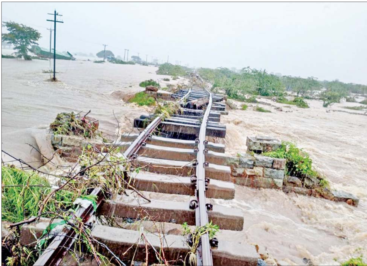
သာစည်-ရွှေညောင်လမ်းပိုင်း လှိုင်းတက်နှင့်ဘုရားငါးဆူကြား တံတားရေတိုက်စားမှုကို တွေ့ရစဉ်။

နေပြည်တော် စက်တင်ဘာ ၁၁ ယခုနှစ်မိုးရာသီအတွင်း မြန်မာ နိုင်ငံအနှံ့အပြားတွင် မိုးသည်ထန်စွာ ရွာသွန်းပြီး ရေကြီးရေလျှံမှုများ ကြောင့် ရန်ကုန်-မန္တလေးလမ်းပိုင်းရှိ တပ်ကုန်း-မကျည်းပင်၊ မကျည်းပင်-ညောင်လွန်၊ ရမည်းသင်း-အင်ကြင်းကန်၊ ပျော်ဘွယ်-ရှမ်းရွာ၊ သပြေတောင်း-သဲတောဘူတာအကြားနှင့် သာစည်-ရွှေညောင်-တောင်ကြီးလမ်းပိုင်းရှိ သာစည်-လှိုင်းတက်၊ လှိုင်းတက်-ဘုရားငါးဆူ၊ ဘုရားငါးဆူ-ယင်းမာပင်၊ မြင်းဒိုက်-ကလေး၊ ကလေး-အောင်ပန်း၊ ထီသိမ်-ပေါမူဘူတာအကြား လမ်းပိုင်းများနှင့် အောင်ပန်းဘူတာ ယာယီရပ်နားတို့တွင် ရေကြီးနစ်မြုပ်မှုများဖြစ်ပေါ်၍ တံတားများ ရေတိုက်စားပြီး ရထားလမ်း ရေကျော်မှုများကြောင့် ရန်ကုန်-မန္တလေးနှင့် သာစည်-ရွှေညောင် ရထားခရီးစဉ်များကို စက်တင်ဘာ ၁၁ ရက်မှ စတင်၍ ယာယီရပ်နားထားကြောင်း သိရသည်။ စာမျက်နှာ ၁၁ ကော်လံ ၁ သို့ ၀