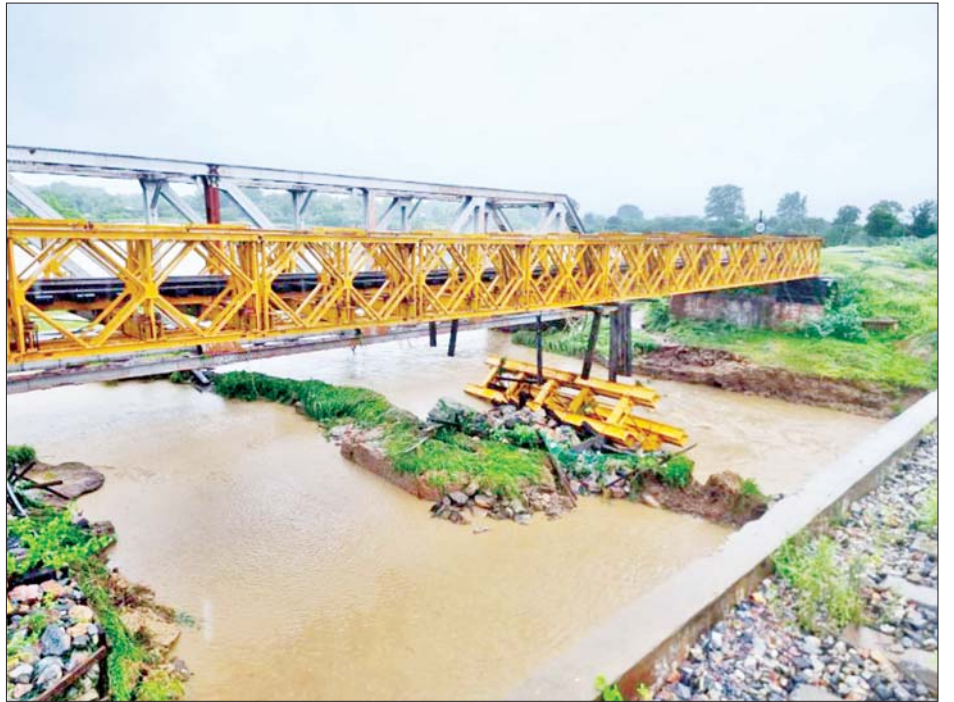
ရန်ကုန်-မန္တလေးရထားလမ်းပိုင်း ရှမ်းရွာနှင့် ရမည်းသင်းဘူတာအကြား ရေတိုက်စားမှုကြောင့် တံတားအမှတ်(၅၂၉) LST ဒေါက်တိုင်ပြတ်ထွက်မှုကိုတွေ့ရစဉ်။