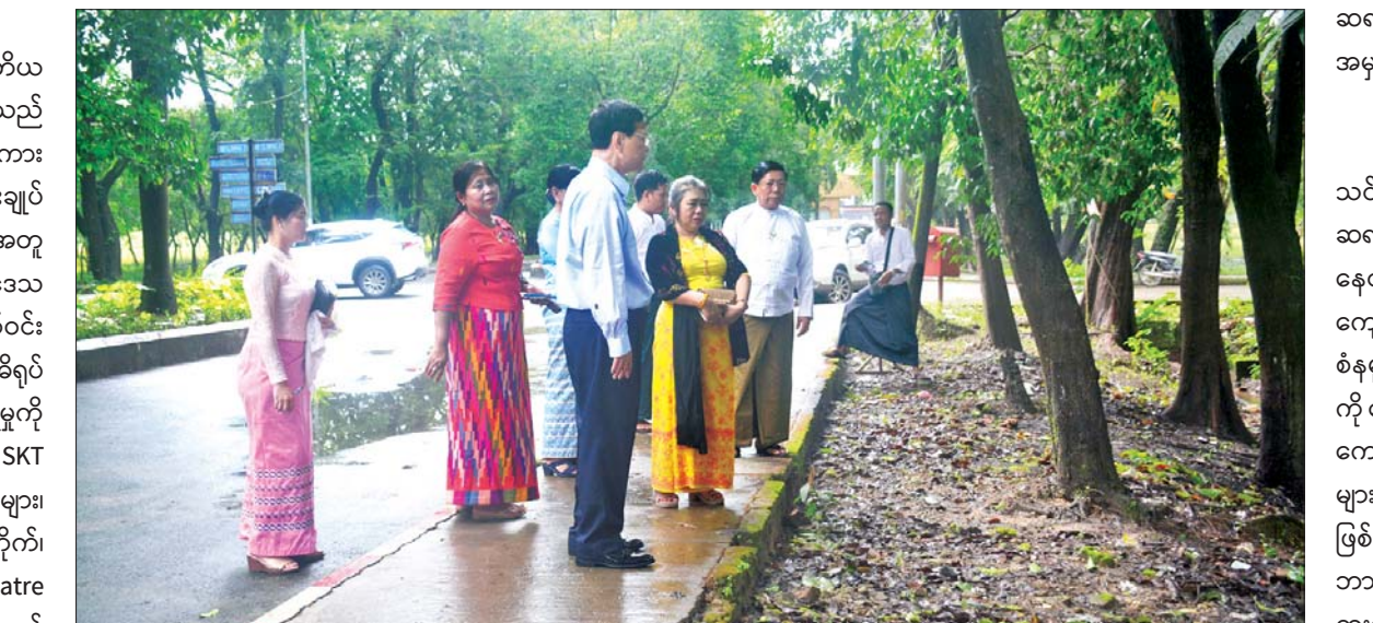
တွေ့ဆုံ မွန်းလွဲပိုင်းတွင် ဒုတိယဝန်ကြီးနှင့် တာဝန်ရှိသူများသည် သင်တန်းကျန်းပညာ ဆရာအတတ်ပညာဦးစီးဌာန ညွှန်ကြားရေးဒီဂရီကောလိပ် ပညာရေးခြည်ခန်းမ၌ ရေးမှူးချုပ်၊ ကျောင်းအုပ်ကြီး၊ ဆရာ

ရန်ကုန် စက်တင်ဘာ ၁၁ ပညာရေးဝန်ကြီးဌာန ဒုတိယ ဝန်ကြီး ဒေါက်တာဇော်မြင့်သည် မြန်မာနိုင်ငံ တိုင်းရင်းသားဘာသာစကား ဦးစီးဌာန ဒုတိယညွှန်ကြားရေးမှူးချုပ် ဦးအောင်သူ၊ တာဝန်ရှိသူများနှင့်အတူ ယနေ့ နံနက်ပိုင်းတွင် ရန်ကုန်တိုင်းဒေသ ကြီး ရန်ကုန်အရှေ့ပိုင်းတက္ကသိုလ်ဝင်း အတွင်း သန့်ရှင်းသာယာရေးနှင့် ဥပမိရပ် ကောင်းမွန်ရေး ဆောင်ရွက်ထားရှိမှုကို လည်းကောင်း၊ သာကေတမြို့နယ် SKT International School ရှိ စာသင်ခန်းများ၊ စားသောက်ခန်းမ၊ စာကြည့်တိုက်၊ သိပ္ပံခန်း၊ အားကစားခန်း၊ Theatre ခန်းမတို့ကိုလည်းကောင်း လှည့်လည် ကြည့်ရှုပြီး လိုအပ်သည်များ မှာကြား သည်။