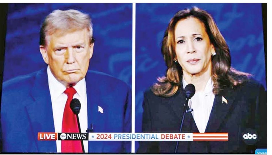
ဆောင်ရွက်အပေါ် စိုးရိမ်မှုများကြောင့် ဇူလိုင်လတွင် ရွေးကောက်ပွဲဝင်ရောက်ယှဉ်ပြိုင်ခြင်းမှ နုတ်ထွက် ခဲ့သည်။ ကိုးကား - ဆင်ဟွာ၊ ဘာသာပြန်-အောင်ကျော်ကျော်

အဆိုပါစကားစစ်ထိုးပွဲသည် ဇွန်လတွင် ဘိုင်ဒင် နှင့် ထရမ်တို့ကြား ပထမအကြိမ် စကားစစ်ထိုးပွဲ ကျင်းပပြီးနောက် လာမည့်ရွေးကောက်ပွဲအတွက် ဒုတိယအကြိမ်မြောက် သမ္မတရွေးကောက်ပွဲဆိုင်ရာ စကားစစ်ထိုးပွဲဖြစ်သည်။ ဂျိုးဘိုင်ဒင်သည် ၎င်း၏ အသက်အရွယ်၊ ကျန်းမာရေးနှင့် အခြေအတင် စွမ်း