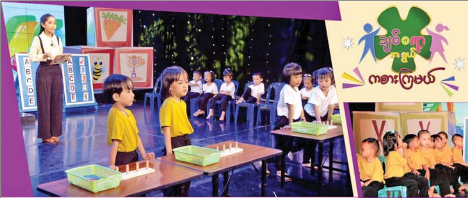
လှိုင်သာယာ (၁) မူလတန်းကြိုကျောင်းနှင့် မင်္ဂလာဒုံ မူလတန်းကြိုကျောင်း ON ▶ ၁၄-၉-၂၀၂၄ (စနေနေ့)၊ နံနက် (၁၁) နာရီ Replay ၁၆-၉-၂၀၂၄ (တနင်္လာနေ့) ညနေ (၇) နာရီ သတင်းအပြည့်

အဆိုပါ အစီအစဉ်ကို ကလေးများ ကိုယ်ခန္ဓာသန်စွမ်းပြီး စိတ်ရွှင်လန်းစေရန်၊ ကလေးများ၏ ကာယ၊ ဉာဏ၊ စာရိတ္တဘက်စုံ ဖွံ့ဖြိုးတိုးတက်စေရန်နှင့် ကလေးငယ်များ အချင်းချင်း ချစ်ချစ် ခင်ခင် ရင်းရင်းနှီးနှီး ပေါင်းသင်း ဆက်ဆံတတ်စေရန် ရည်ရွယ်ချက်ဖြင့် ပြန်ကြားရေးဝန်ကြီးဌာန မြန်မာ့အသံနှင့် ရုပ်မြင်သံကြားနှင့် လူမှုဝန်ထမ်း၊ ကယ်ဆယ်ရေးနှင့် ပြန်လည်နေရာချထားရေးဝန်ကြီးဌာန၊ လူမှုဝန်ထမ်းဦးစီးဌာနတို့ ပူးပေါင်း စီစဉ်တင်ဆက်ခြင်းဖြစ်ပြီး MRTV App မှလည်း Streaming ထုတ်လွှင့်မည်ဖြစ်ရာ တစ်ချိန်တည်း ကြည့်ရှုနိုင်မည်ဖြစ်သည်။