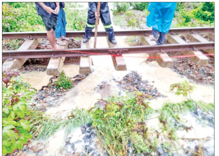
ရန်ကုန်-မန္တလေးရထားလမ်းပိုင်း ရှမ်းရွာနှင့် ပျော်ဘွယ်ဘူတာအကြား ရထားလမ်းတာပေါင်များရေတိုက်စားပြီး ထူးပေါက်မှုကိုတွေ့ရစဉ်။