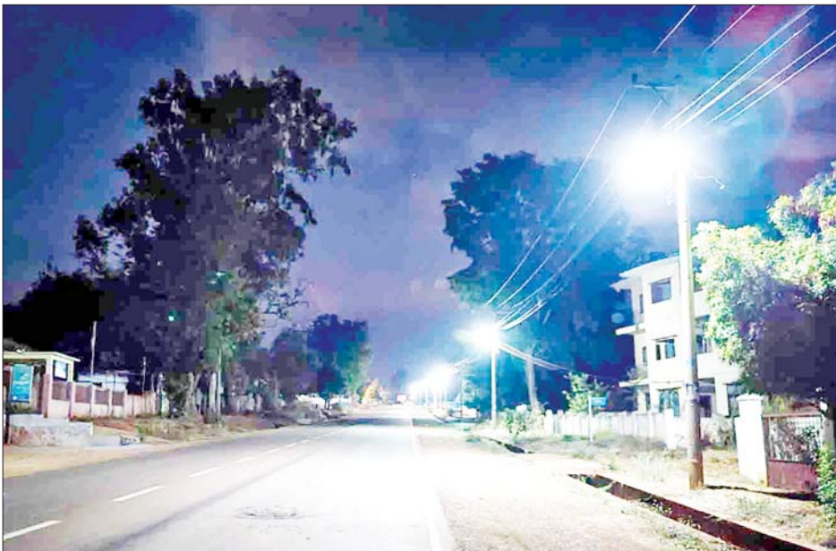
ပြီးစီးပြီဖြစ်၍ မြို့ပေါ်ရှိလမ်းမီးများ နေပြီဖြစ်သည်။ ယင်းနောက် တွင် လျှပ်စစ်မီးပြန်လည်ထွန်းလင်း ဌာနဆိုင်ရာရုံးများနှင့် ရပ်ကွက်ရှိ

ဆီဆိုင် မေ ၂၀ ရှမ်းပြည်နယ် (တောင်ပိုင်း) ပအိုဝ်း ကိုယ်ပိုင်အုပ်ချုပ်ခွင့်ရ ဒေသ ဆီဆိုင်မြို့နယ်တွင် ဒေသ လုံခြုံရေးအခြေအနေ ပြန်လည် ကောင်းမွန်လာပြီဖြစ်၍ ပြန်လည် ထူထောင်ရေး လုပ်ငန်းများ ဆောင်ရွက်လျက်ရှိရာ လမ်းမီး များ ပြန်လည်ထွန်းလင်းနေပြီ ဖြစ်ကြောင်း သိရသည်။