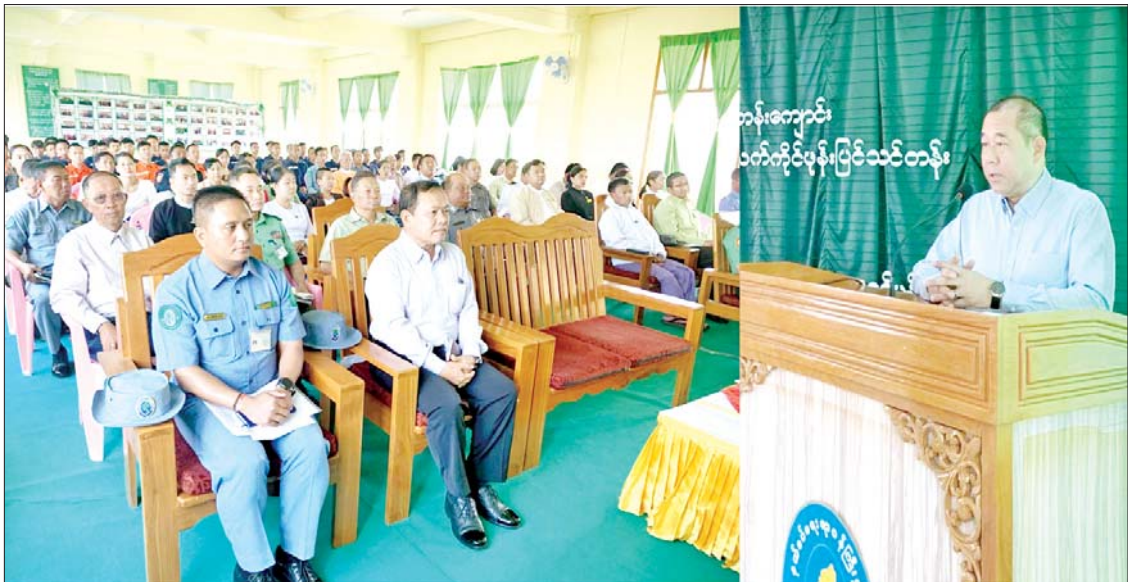
နယ်စပ်ရေးရာဝန်ကြီးဌာန ပြည်ထောင်စုဝန်ကြီး ဒုတိယဗိုလ်ချုပ်ကြီး ထွန်းထွန်းနောင် နယ်စပ်ဒေသတိုင်းရင်းသားလူငယ်များ စက်မှုလက်မှုပညာသင်တန်းကျောင်း (အောင်ပန်း) သင်တန်းဖွင့်ပွဲ အခမ်းအနားတွင် အမှာစကားပြောကြားစဉ်။

အုပ်ချုပ်ရေးအဖွဲ့ဥက္ကဋ္ဌ ဦးလွင်ကိုဦးက လည်းကောင်း အသီးသီး တက်ရောက်၍ သင်တန်းဖွင့်ပွဲအမှာစကား ပြောကြားသည်။ အဆိုပါ သင်တန်းကျောင်းသုံးကျောင်း၌ ဆောက်လုပ်ရေးသင်တန်း၊ လျှပ်စစ်သင်တန်း၊ ဂဟေသင်တန်း၊ မော်တော်ယာဉ်စက်ပြင်သင်တန်း၊ လက်ကိုင်ဖုန်းပြင်သင်တန်းများတွင် သင်တန်းသားစုစုပေါင်း ၁၂၅ ဦးဖြင့် သင်တန်းကာလရက်သတ္တ ၂၂ ပတ်ကြာ သင်ကြားဖွင့်လှစ်ပို့ချသွားမည်ဖြစ်ပြီး နေထိုင်စားသောက်ရေးနှင့် သင်တန်းသုံးပစ္စည်းများ အခမဲ့ပံ့ပိုးပေးသွားမည်ဖြစ်သည်။ နယ်စပ်ဒေသတိုင်းရင်းသား လူငယ်များ စက်မှုလက်မှုပညာသင်တန်းကျောင်းများတွင် သင်တန်းသား စုစုပေါင်း ၆၄၇၇ ဦး သင်ကြားလေ့ကျင့် မွေးထုတ်ပေးခဲ့ပြီး အလုပ်အကိုင်အခွင့်အလမ်းများ ပန်တီးပေးခဲ့ကြောင်း သိရသည်။ သတင်းစဉ်