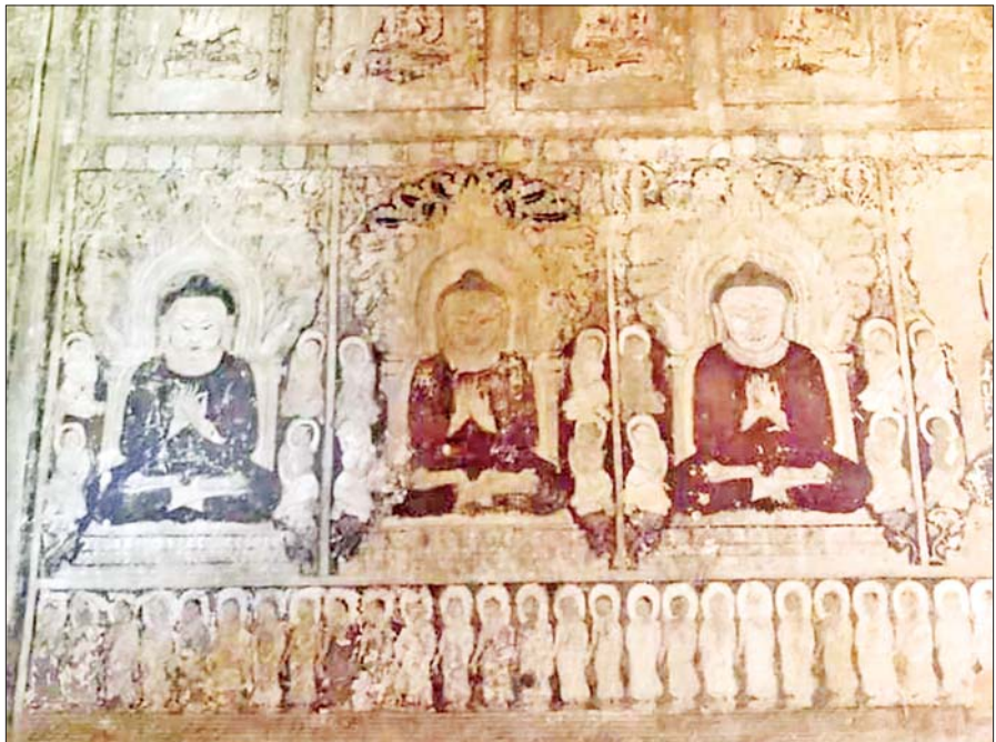
ပုဂံခေတ်လက်ကျန် နံရံဆေးရေးပန်းချီအချို့ကို တွေ့မြင်ရစဉ်။