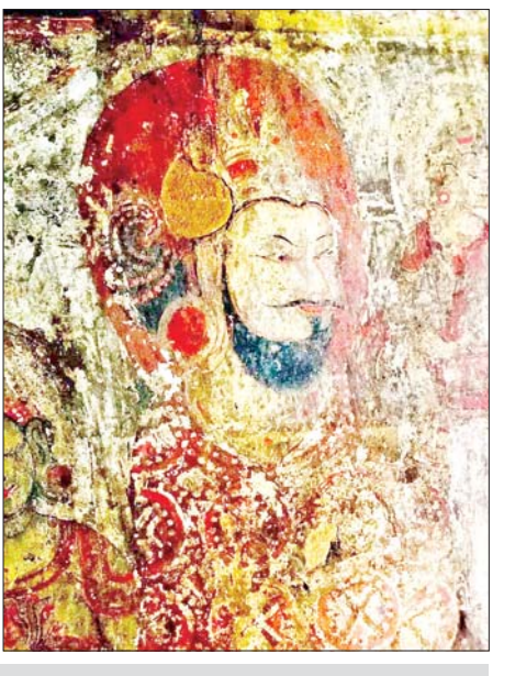
ပုဂံခေတ်လက်ကျန် နံရံဆေးရေးပန်းချီအချို့ကို တွေ့မြင်ရစဉ်။

ပုဂံခေတ် နံရံဆေးရေးပန်းချီရေးဆွဲကြသည့် ပညာရှင်များမှာ တစ်ဦးတစ်ယောက်စု နှစ်ယောက်စုမဟုတ် အဖွဲ့လိုက် အစုလိုက် ဆောင်ရွက်ခဲ့ကြပုံရကြောင်းနှင့် အထူးသဖြင့် အဆိုပါပုဂ္ဂိုလ်များမှာ ပန်းချီဆွဲသည့်အတတ်ပညာပင်မဟုတ် ဗုဒ္ဓဝင်ဇာတ်နိပါတ်များဖြင့်လည်း ထဲထဲဝင်ဝင် နှံ့နှံ့စပ်စပ်သိရှိကြသူများလည်းဖြစ်ပုံရကာ ၎င်းတို့၏ နောက်ကွယ်တွင် ဗုဒ္ဓစာပေကျမ်းဂန်များတတ်ကျွမ်းသည့် ဆရာတော် မထေရ်ကြီးများကလည်းအနီးကပ် လမ်းညွှန်ခဲ့ကြပုံရကြောင်း ၎င်းက