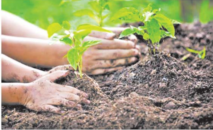
“ သဲကန္တာရတိုက်ဖျက်ရေးနှင့် မိုးခေါင်ရေရှားဒဏ်ခံနိုင်ရေး မြေယာပြန်လည်ပြုပြင်ပေး ” “ Land restoration, desertification and drought resilience ”