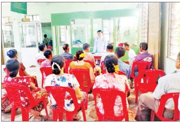
၁၅၀၀၀၀ နှုန်းဖြင့် ထုတ်ချေးပေး လျက်ရှိကြောင်း သိရသည်။

ကျိုက်မရော မေ ၂၀ မွန်ပြည်နယ် ကျိုက်မရော မြို့နယ် မြန်မာ့လယ်ယာဖွံ့ဖြိုးရေး ဘဏ်ခွဲ၌ ၂၀၂၄ ခုနှစ် မိုးရာသီ စိုက်ပျိုးစရိတ် ချေးငွေများကို ယနေ့နံနက် ၉ နာရီမှ စတင်ကာ ထုတ်ချေးပေးလျက်ရှိသည်။ ထိုသို့ ချေးငွေထုတ်ချေးရာတွင် ယခင်စိုက်ပျိုးစရိတ် ချေးငွေ ကြွေးကျန် မရှိသူများအား အတိုးနှုန်း ၅ ရာခိုင်နှုန်းဖြင့် ဦးစားပေး ထုတ်ပေးခြင်းဖြစ်ပြီး မိုးစပါးတစ်ဧကလျှင် ငွေကျပ်