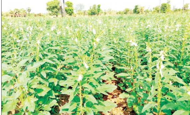
သတင်းရင်းမြစ် - စီးပွား/ကူးသန်း

၂၀- ၅ - ၂၀၂၄ ရက်နေ့ တိုင်းဒေသကြီးနှင့်ပြည်နယ်၊ မြို့နယ်အလိုက် ဆန်၊ ဆီ၊ မီးဖိုချောင်သုံးပစ္စည်းများ၊ သားငါးဈေးနှုန်းများ