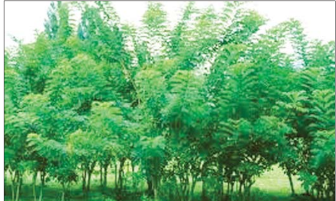
မြေနိမ့်ချယ်ရီပင်။

● မြေနိမ့်ချယ်ရီပင်သည် အလယ်အလတ်တန်းစားသစ်ပင်ဖြစ်ပြီး အပင် အမြင့် ၃၀ - ၃၅ ပေခန့် ရှိနိုင်ပါသည်။ အကြီးမြန် နိုက်ထရိုဂျင်ဖမ်းယူပေးသော အပင်ဖြစ်ရုံမက ကိုမာရင်ဓာတ် (Coumarin) အနံ့ဆိုးကြောင့် ခြင်ပြေးစေသော အပင်ဖြစ်ပါသည်။ ဤအပင်၏ အရွက်ထွက်နှုန်းမှာ ဘောစကိုင်းထက်ပိုပါသည်။ သီးနှံအထွက်တိုးရေး အထောက်အကူပြုအပင်နှင့် သစ်ရွက်စိမ်းမြေဩဇာအဖြစ်လည်း အသုံးပြုနိုင်ပါသည်။ ထိုအပင်၏ အရွက်များကိုခြေ၍ မြေကြီးထဲသို့ ထည့်ပေးခြင်းဖြင့် သစ်စိမ်းမြေဩဇာဖြစ်