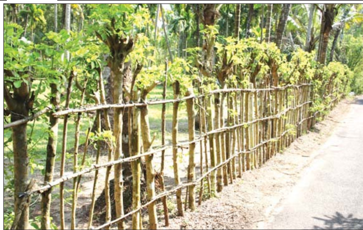
မြေနိမ့် ချယ်ရီပင်အား ခြံစည်းရိုးတိုင် အဖြစ် အသုံးပြုထားသည် ကို တွေ့ရစဉ်။

◆ စာမျက်နှာ ၈ မှ အသုံးပြုပုံများ ဤအပင်ကို (က) ထင်းအဖြစ် အသုံးပြုနိုင်ပါသည်။ ယင်းသည် ပြည်ပညင်းရွာ မီးလောင်နိုင်ပြီး အပူတန်ဖိုး တစ်တီလို ၁၉ ဒဿမ ၈ မက်ဂါဂျိုး (19.8 MJ/kg) အထိ ရရှိနိုင်ပါသည်။ တစ်နှစ်လျှင် တစ်ဟက် တာ ထင်း ၆ ဒဿမ ၃ တန်အထိ ထွက်နိုင်ပါသည်။ (ခ) ဆောက်လုပ်ရေးသုံးတိုင်နှင့် သက်ရှိခြံစည်းရိုးတိုင်အဖြစ် အသုံးပြုနိုင်ပါသည်။ ယင်းသည် ခြံတိုင်အဖြစ် တစ်ပေမှ ခြောက်ပေအကွာနှင့် အချင်း ခြောက်လက်မ ကျင်းတူး၍