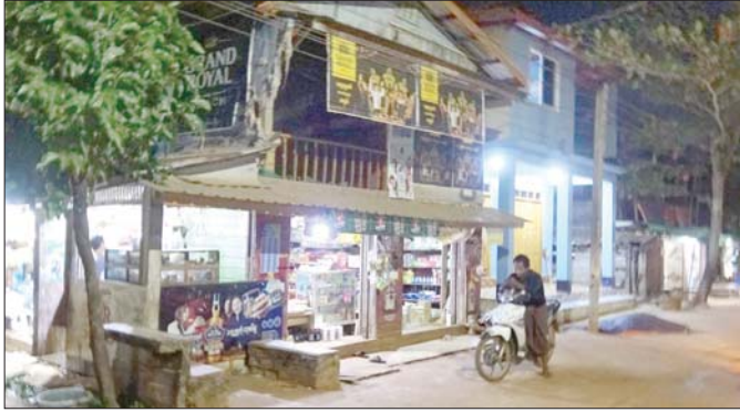
အောင်ဘာကျေးရွာအတွင်း ညမြင်ကွင်း။

အတူမျှဝေခံစားချင်ပါသော ထိုပီတိ... ကျေးရွာနှစ်ရွာလုံးသည် တနင်္သာရီတိုင်းဒေသကြီး ကော့သောင်းမြို့နယ်အတွင်း တည်ရှိပြီး အောင်ဘာကျေးရွာတွင် ၁၇၀ ဒဿမ ၂၄ ကီလိုပင် ဆိုလာအသေးစား ဓာတ်အားပေးစနစ်နှင့် အောင်မြင်မကျေးရွာတွင် ၁၇၀ ဒဿမ ၆ ကီလိုပင် ဆိုလာအသေးစား ဓာတ်အားပေးစနစ်တို့ကို တည်ဆောက်ခဲ့ခြင်းဖြစ်သည်။ အောင်ဘာကျေးရွာအတွင်း ဓာတ်အားဖြန့်ဖြူးပေးနိုင်ခဲ့ပြီးနောက် အောင်မြင်မကျေးရွာ၌ ၂၀၂၁ ခုနှစ် ဩဂုတ်လတွင် ဓာတ်အားစတင်ဖြန့်ဖြူးခဲ့ခြင်း ဖြစ်သည်။ လက်ရှိတွင် အိမ်ခြေ ၄၀၀၊ ၄၅၀ ဝန်းကျင်ခန့် လျှပ်စစ်မီးချိတ်ဆက်ရယူပြီးဖြစ်ကြောင်း သိရသည်။