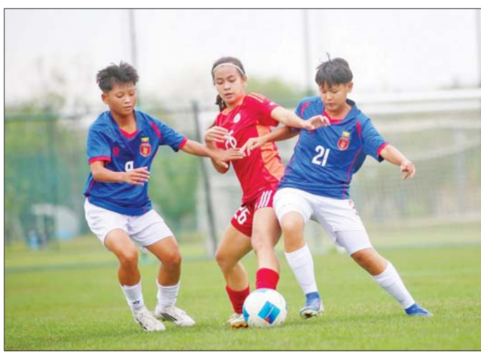
မြန်မာ ယူ-၁၇ အမျိုးသမီးအသင်းနှင့် ဖိလစ်ပိုင် ယူ-၁၇ အမျိုးသမီးအသင်းတို့ ခြေစမ်းပွဲကစားစဉ်။

ရန်ကုန် ဧပြီ ၂၃ ၂၀၂၆ အာရှဖလား ယူ-၁၇ အမျိုးသမီးပြိုင်ပွဲအကြို တရုတ်နိုင်ငံ၌ လေ့ကျင့်နေသည့် မြန်မာ ယူ-၁၇ အမျိုးသမီးလူငယ် လက်ရွေးစင်အသင်းသည် ဧပြီ ၂၃ ရက်က ဖိလစ်ပိုင် ယူ-၁၇ အမျိုးသမီးလူငယ်လက်ရွေးစင်အသင်းနှင့် ခြေစမ်းပွဲ ယှဉ်ပြိုင်ကစားခဲ့သည်။ မြန်မာနှင့် ဖိလစ်ပိုင် ယူ-၁၇ အမျိုးသမီးအသင်းသည် Training Match ကစားသောကြောင့် ရလဒ်ပိုင်း ထုတ်ပြန်ခြင်းမရှိဘဲ အသင်းပြင်ဆင်မှုအပိုင်းနှင့် နည်းဗျူဟာပိုင်းကိုသာ ဦးစားပေးပြင်ဆင်ခဲ့သည်။ နှစ်သင်းစလုံးသည် အာရှဖလားပြိုင်ပွဲ ယှဉ်ပြိုင်ရန် စာမျက်နှာ ၁၆ ကော်လံ ၅ သို့ ❖