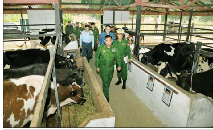
တပ်မတော်ကာကွယ်ရေးဦးစီးချုပ် ဗိုလ်ချုပ်ကြီး ရဲဝင်းဦး ကြိတ်ဒေသတိုင်းစစ်ဌာနချုပ် စိုက်ပျိုး/မွေးမြူရေးဇုန်တွင် ကြည့်ရှုစစ်ဆေးစဉ်။

တပ်တွင်းစည်းလုံးညီညွတ်ရေးများတွင် ဦးဆောင်သူများသည် မှန်ကန်သော ဦးဆောင်မှုများ လုပ်ဆောင်သွားရန်လိုပြီး မှန်ကန်သော ဦးဆောင်မှုသည်မှာ ခေါင်းဆောင်မှု အင်္ဂါရပ်များနှင့် ကိုက်ညီလုပ်ဆောင်ရန်လိုကြောင်း၊ တပ်မတော်သားများအနေဖြင့် စစ်စည်းကမ်းနှင့်အညီ နေထိုင်ကျင့်ကြံရမည် ဖြစ်ပြီး တစ်ဦးချင်းနှင့် အဖွဲ့အစည်းအပေါ် ထိခိုက်စေနိုင်သည့် လုပ်ကိုင်ပြုမူနေထိုင်မှုများကို ရှောင်ကြဉ်ကြရန် လိုကြောင်း၊ အသောက်အစားအပျော်အပါးများကြောင့် မိမိတို့ တစ်ဦးချင်း စွမ်းဆောင်ရည်များနှင့် မိမိတို့၏ မိသားစု၊ အဖွဲ့အစည်းအပေါ်တွင် ထိခိုက်မှုမရှိအောင် ထိန်းသိမ်းသိမ်းသိမ်းနေထိုင်ကြရမည်ဖြစ်ကြောင်း။ တပ်မတော် အနေဖြင့် တပ်မတော်သားများနှင့် မိသားစုဝင်များ၏ သက်သာချောင်ချိရေးအတွက် နေရေး၊ စားရေး၊ ဝတ်ရေး၊ ကျန်းမာရေးနှင့် အခြားအထွေထွေလိုအပ်ချက်များကို တတ်စွမ်းသရွေ့ အမြဲမပြတ်ပြည့်ဆည်းပေးလျက်ရှိပြီး ထိုကဲ့သို့သည့် ချီးမြှင့်မှုများနှင့်လိုအပ်သည့် သက်သာချောင်ချိရေး ကိစ္စရပ်များကို စာမျက်နှာ ၆ သို့ ၁