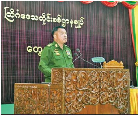
တပ်မတော်ကာကွယ်ရေးဦးစီးချုပ် ဗိုလ်ချုပ်ကြီး ရဲဝင်းဦး ကျိုင်းတုံတပ်နယ်မှ အရာရှိ၊ စစ်သည်၊ မိသားစုများအား တွေ့ဆုံအမှာစကားပြောကြားစဉ်။

နေပြည်တော် ဧပြီ ၂၃ တပ်မတော်ကာကွယ်ရေးဦးစီးချုပ် ဗိုလ်ချုပ်ကြီး ရဲဝင်းဦးသည် ယမန်နေ့ မွန်းလွဲပိုင်းတွင် ကျိုင်းတုံတပ်နယ်မှ အရာရှိ၊ စစ်သည်၊ မိသားစုများအား တိုင်းစစ်ဌာနချုပ် ပြည်ငြိမ်းအေးခန်းမ၌လည်းကောင်း၊ ယနေ့ မွန်းလွဲပိုင်းတွင် မိုင်းခတ်နှင့် မိုင်းယန်းတပ်နယ်မှ အရာရှိ၊ စစ်သည်၊ မိသားစုများအား မိုင်းခတ်တပ်နယ်ခန်းမ၌လည်းကောင်း သီးခြားစီ တွေ့ဆုံအမှာစကားပြောကြားသည်။