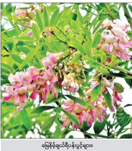
မြေနိမ့်ချယ်ရီပန်းပွင့်များ။

(၇) ခြစည်းရိုးပင်အဖြစ်လည်းကောင်း၊ နှစ်ရှည်ပင်များအတွက် အရှိပင်နှင့် နွယ်တက်သော စိုက်ပျိုးပင်များအတွက် စင်အဖြစ်လည်းကောင်း အထောက်အပံ့ဖြစ်စေပါသည်။ ထိုကောင်းကျိုးများကြောင့် တစ်ကမ္ဘာလုံး များပြားစွာ သုတေသနပြု အသုံးပြုလာပါပြီ။