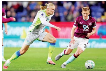
ဘန်လေအသင်းနှင့် မန်စီးတီးအသင်းတို့ ယှဉ်ပြိုင်ကစားကြစဉ်။

ဘန်လေအသင်းနဲ့ မန်စီးတီးအသင်းတို့ ဧပြီ ၂၃ ရက် နံနက်ပိုင်းက ယှဉ်ပြိုင်ကစားခဲ့တဲ့ ပရီမီယာလိဂ်ပွဲစဉ်မှာ မန်စီးတီးအသင်းက ဘန်လေအသင်းကို အနိုင်ရပြီး ပရီမီယာလိဂ်အမှတ်ပေးဇယားထိပ်ဆုံးကို တက်လှမ်းခွင့်ရရှိခဲ့ပါတယ်။ ဘန်လေအသင်းနဲ့ မန်စီးတီးအသင်းတို့ ပွဲစဉ်မှာ ဧည့်သည်အဖြစ် လာရောက်ကစားခဲ့တဲ့ မန်စီးတီးအသင်းက ပထမပိုင်းပွဲကစားချိန် ငါးမိနစ်မှာရရှိခဲ့တဲ့ တိုက်စစ်မှူးဟာလန်းရဲ့ တစ်လုံးတည်းသောသွင်းဂိုးဖြင့် အနိုင်ရရှိခဲ့တာပဲဖြစ်ပါတယ်။ အခုပွဲစဉ်မှာ မန်စီးတီးအသင်းအတွက် အနိုင်ရိုးသွင်းယူပေးခဲ့တဲ့ တိုက်စစ်မှူးဟာလန်းဟာ ဘန်လေအသင်းနဲ့ နောက်ဆုံးတွေ့ဆုံခဲ့တဲ့ ငါးပွဲမှာ သွင်းဂိုးရှစ်ဂိုးအထိ သွင်းယူနိုင်ခဲ့ပြီလည်းဖြစ်ပါတယ်။ မန်စီးတီးအသင်းဟာ ဘန်လေအသင်းကို အနိုင်ရရှိခဲ့တာကြောင့် စာမျက်နှာ ၂၂ ကော်လံ ၃ သို့ ❖