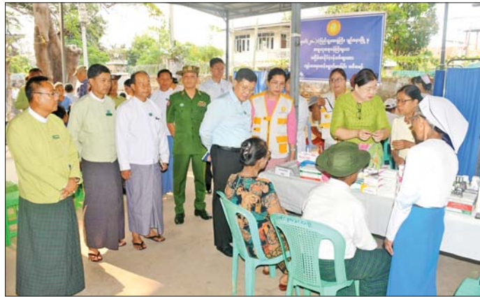
ဖြည့်ပွဲ ဖွင့်ပွဲအခမ်းအနားကို နေပြည်တော် ဧပြီ ၂၃ ရက်နေ့ ဖြို့နယ် နေပြည်တော်ကောင်စီဥက္ကဋ္ဌက အမှန်းမရှိ ကျင်းပသည်။ ဦးစွာ နေပြည်တော်ကောင်စီဥက္ကဋ္ဌက အမှန်းမရှိ ကျင်းပသည်။

နေပြည်တော် ဧပြီ ၂၃ နေပြည်တော်ကောင်စီဥက္ကဋ္ဌ ဦးကဲမြင့်သန်းသည် ယနေ့နံနက်ပိုင်းတွင် နေပြည်တော်ကောင်စီဝင်များ၊ တာဝန်ရှိသူများနှင့်အတူ ပျဉ်းမနားမြို့ မြန်မာစီးပွားရေးဘဏ်သို့ သွားရောက်၍ ပင်စင်လစာ လာရောက်ထုတ်ယူကြသည့် အငြိမ်းစားနိုင်ငံ့ဝန်ထမ်းများကို ခုတင်-၂၀၀ ဆံ ပြည်သူ့ဆေးရုံကြီး ပျဉ်းမနားမြို့မှ အထူးကုဆရာဝန်ကြီးများက ကျန်းမာရေးအခမဲ့စောင့်ရှောက်ပေးနေမှုနှင့် အငြိမ်းစားပင်စင်လစာထုတ်ပေးနေမှုအခြေအနေများကို ကြည့်ရှုအားပေးပြီး တာဝန်ရှိသူများအား လိုအပ်သည်များမှာကြား၍ အငြိမ်းစားနိုင်ငံ့ဝန်ထမ်းများအား ရင်းနှီးနှီးနှီးတွေ့ဆုံ အားပေးစကားပြောကြားကာ အခြေခံစားသောက်ကုန်များ ပေးအပ်သည်။ မွန်းလုံပိုင်းတွင် ၂၀၂၆ ခုနှစ် နေပြည်တော်ကောင်စီဥက္ကဋ္ဌဖလား ဖြို့နယ်ပေါင်းစုံ အသက်(၂၅)နှစ်အောက် အမျိုးသား/အမျိုးသမီး ဘော်လီဘော