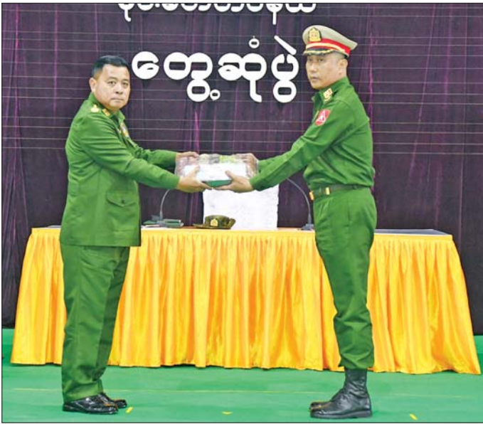
တပ်မတော်ကာကွယ်ရေးဦးစီးချုပ် ဗိုလ်ချုပ်ကြီး ရဲဝင်းဦး မိုင်းခတ်နှင့် မိုင်းယန်းတပ်နယ်မှ အရာရှိ၊ စစ်သည်၊ မိသားစုများအတွက် စားသောက်ဖွယ်ရာပစ္စည်းများနှင့် ချီးမြှင့်ငွေများ ပေးအပ်စဉ်။

အဆိုပါ တွေ့ဆုံပွဲ၌ တပ်မတော်ကာကွယ်ရေးဦးစီးချုပ်၏ ဇနီးဒေါ်နီလော၊ ကာကွယ်ရေးဦးစီးချုပ် (ရေ) ဗိုလ်ချုပ်ကြီး ထိန်ဝင်းနှင့် ဇနီး၊ ကာကွယ်ရေးဦးစီးချုပ် (လေ) ဒုတိယဗိုလ်ချုပ်ကြီး ထွန်းဝင်းနှင့် ဇနီး၊ ကာကွယ်ရေးဦးစီးချုပ်ရုံးမှ အဆင့်မြင့် တပ်မတော်အရာရှိကြီးများနှင့် ဇနီးများ၊ ကြိတ်ဒေသတိုင်းစစ်ဌာနချုပ် တိုင်းမှူးနှင့် တပ်နယ်များမှ အရာရှိ၊ စစ်သည်၊ မိသားစုများ တက်ရောက်ကြသည်။