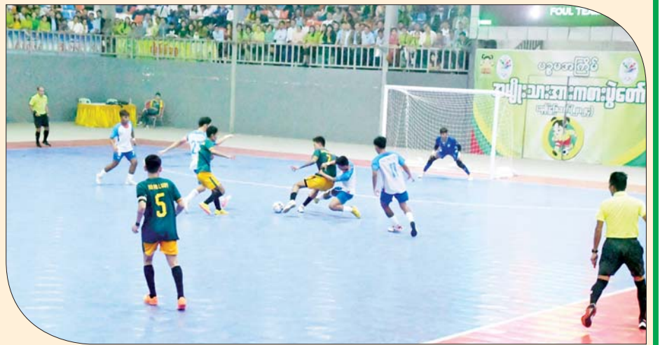
ဝန်ကြီးဌာနပေါင်းစုံ အမျိုးသားဖူဆယ်ပြိုင်ပွဲတွင် စီးပွားရေးနှင့်ကူးသန်းရောင်းဝယ်ရေးဝန်ကြီး ဌာနအသင်းနှင့် ပို့ဆောင်ရေးနှင့်ဆက်သွယ်ရေးဝန်ကြီးဌာနအသင်းတို့ ယှဉ်ပြိုင်ကစားကြစဉ်။