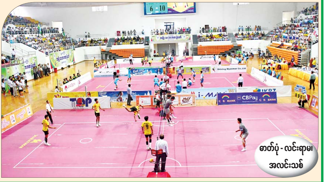
ဝန်ကြီးဌာနပေါင်းစုံ အမျိုးသားပိုက်ကျော်ခြင်းပြိုင်ပွဲများ ကျင်းပစဉ်။