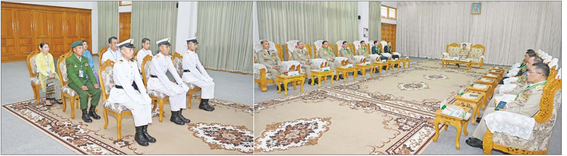
နိုင်ငံတော်စီမံအုပ်ချုပ်ရေးကောင်စီဥက္ကဋ္ဌ တပ်မတော်ကာကွယ်ရေးဦးစီးချုပ် ဗိုလ်ချုပ်မှူးကြီး သတိုးမဟာသရေစည်သူ သတိုးသီရိသုဓမ္မ မင်းအောင်လှိုင် ထူးချွန်ဆုရရှိကြသည့် ဗိုလ်လောင်းများနှင့် မိဘများအား တွေ့ဆုံ၍ ဂုဏ်ပြုအမှာစကားပြောကြားစဉ်။

»» စာမျက်နှာ ၄ မှ လွန်စွာအရေးကြီးကြောင်း၊ ပြည်သူ့လူထု၏ ကျန်းမာရေးနှင့်ပတ်သက်ပြီး “လူ့အသက်ထက် အရေးကြီးတာ ဘာမှမရှိ” ဟူသည့်အတိုင်း မိမိတို့တပ်မတော်အနေဖြင့်လည်း ပြည်သူ့လူထုအတွက် ပိုမိုကောင်းမွန်သည့် ကျန်းမာရေးစောင့်ရှောက်မှုလုပ်ငန်းများ၊ ပြည်သူများ၏ နေ့စဉ်လူမှုဘဝ လုံခြုံရေးကိုပါ ဘက်ပေါင်းစုံက ကူညီဆောင်ရွက်ပေးရမည်ဖြစ်ကြောင်း။