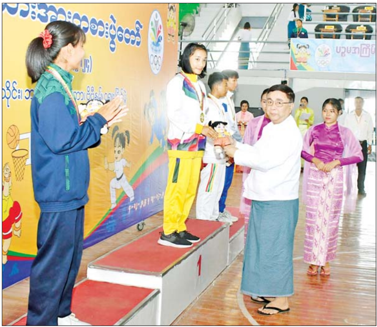
ပြည်ထောင်စုဝန်ကြီး ဒေါက်တာညွန့်ဖေ ပြည်နယ်နှင့် တိုင်းဒေသကြီးအဆင့် ဂူရှားပြိုင်ပွဲ အမျိုးသမီး ၄၅ ကီလိုတန်း အတိုက်ပြိုင်ပွဲတွင် ပထမဆုရရှိသည့် တနင်္သာရီတိုင်းဒေသကြီးမှ ပြိုင်ပွဲဝင်တစ်ဦးအား ဆုချီးမြှင့်စဉ်။