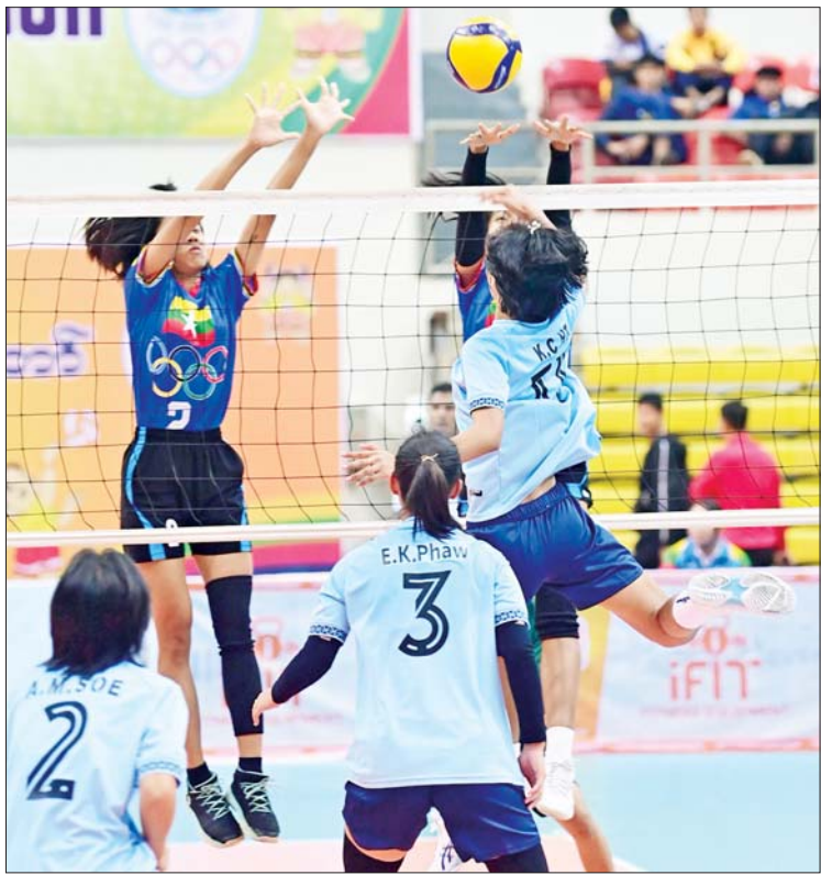
ဝန်ကြီးဌာနပေါင်းစုံ အမျိုးသမီးဘော်လီဘောပြိုင်ပွဲတွင် ပို့ဆောင်ရေးနှင့် ဆက်သွယ်ရေးဝန်ကြီးဌာနအသင်းနှင့် အားကစားနှင့် လူငယ်ရေးရာဝန်ကြီးဌာန အသင်းတို့ ယှဉ်ပြိုင်ကစားကြစဉ်။

တိုက်ဖျက်ရေးကော်မရှင်အသင်းကို နှစ် ပွဲပြတ်၊ နယ်စပ်ရေးရာဝန်ကြီးဌာနအသင်း က ပို့ဆောင်ရေးနှင့် ဆက်သွယ်ရေးဝန်ကြီး ဌာနအသင်းကို နှစ်ပွဲ တစ်ပွဲ၊ ဆောက်လုပ် ရေးဝန်ကြီးဌာနအသင်းက ကာကွယ်ရေး ဝန်ကြီးဌာနအသင်းကို နှစ်ပွဲ တစ်ပွဲ၊ အားကစားနှင့် လူငယ်ရေးရာဝန်ကြီးဌာန အသင်းက သာသနာရေးနှင့် ယဉ်ကျေးမှု ဝန်ကြီးဌာနအသင်းကို နှစ်ပွဲပြတ်၊ အလုပ် သမားဝန်ကြီးဌာနအသင်းက ဟိုတယ်နှင့် ခရီးသွားလာရေးဝန်ကြီးဌာနအသင်းကို နှစ်ပွဲပြတ်ဖြင့် အနိုင်ရရှိကြသည်။ ပြည်နယ်နှင့် တိုင်းဒေသကြီး အသက် ၂၀ နှစ်အောက် အမျိုးသား ဘောလုံးပြိုင်ပွဲ တတိယလှည့်စဉ် ဗိုလ်လုပွဲစဉ်ကို ဝဏ္ဏသိဒ္ဓိ အားကစားကွင်း လေ့ကျင့်ရေးကွင်း(၃)နှင့် ရွှေကြာပင် အားကစားကွင်းတို့၌ လည်းကောင်း၊ ပြည်နယ်နှင့် တိုင်းဒေသ ကြီး ရိုးရာခြင်းလုံးပြိုင်ပွဲ ဗိုလ်လုပွဲကို ဝဏ္ဏသိဒ္ဓိအားကစားကွင်း(C) ရုံ၌ လည်း ကောင်း၊ ပြည်နယ်နှင့် တိုင်းဒေသကြီး ဘိုလီယက်/စနူကာပြိုင်ပွဲ ဘိုလီယက် တစ်ဦးချင်း ဗိုလ်လုပွဲစဉ်၊ ဘိုလီယက် နှစ်ယောက်တွဲ ဗိုလ်လုပွဲစဉ်၊ စနူကာ 15- Red တစ်ဦးချင်းဗိုလ်လုပွဲစဉ်၊ စနူကာ 15- Red နှစ်ယောက်တွဲ ဗိုလ်လုပွဲစဉ်တို့ ကို ဝဏ္ဏသိဒ္ဓိအားကစားကွင်းဘိုလီယက်ရုံ ၌ လည်းကောင်း၊ ပြည်နယ်နှင့်တိုင်းဒေသ