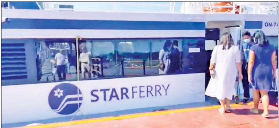
Star Ferry ရေလမ်းခရီးဝန်ဆောင်မှုအား ရန်ကုန်ပန်းဆိုးတန်းနှင့် Star City သို့ ပြေးဆွဲပေးစဉ်။

ကင်းဝေးကာ Star Ferry ဝန်ဆောင်မှုဖြင့် Star City အိမ်ရာတွင်နေထိုင်ကြသော ရုံးသွား၊ ရုံးပြန် အသုံးပြု သူများနှင့် စီးနင်းလိုက်ပါသူများအားလုံးအတွက် အဆင်ပြေချောမွေ့စေခဲ့ကြောင်း Star City Thanlyin ၏ ထုတ်ပြန်ချက်၌ ပါရှိသည်။ ယခုနှစ် ဇွန်လမှစတင်ပြီး လေးလမ်းသွား အမှတ် (၃) သန်လျင်တံတားအသစ်ကို စတင်ဖွင့်လှစ်ခဲ့သော ကြောင့် သွားလာရေး လွယ်ကူအဆင်ပြေချောမွေ့ နေပြီဖြစ်ပြီး Star Ferry ရေကြောင်းဝန်ဆောင်မှုထက် လည်း ပိုမိုမြန်ဆန်ကာ သွားလာနိုင်ပြီဖြစ်ကြောင်း၊ ထို့ကြောင့် Star Ferry ဝန်ဆောင်မှုကို ရပ်နားသွား မည်ဖြစ်ပြီး ခရီးသည်များအတွက် ပိုမိုအဆင်ပြေစေ ရန်ရည်ရွယ်၍ Shuttle Bus ဝန်ဆောင်မှုအသစ် ကိုစတင်မိတ်ဆက်မည်ဖြစ်ကြောင်းနှင့် Shuttle Bus