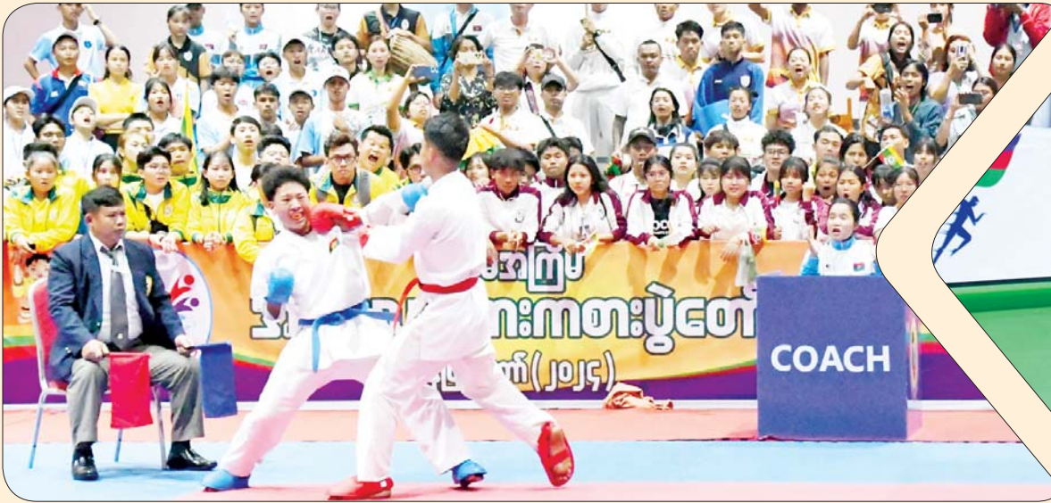
ပြည်နယ်နှင့် တိုင်းဒေသကြီး ကရာတေးပြိုင်ပွဲ အမျိုးသား ကုမိတ်ပြိုင်ပွဲတွင် ရှမ်းပြည်နယ်နှင့် ကယားပြည်နယ်တို့မှ ပြိုင်ပွဲဝင်များ ယှဉ်ပြိုင်စဉ်။