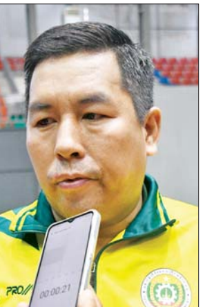
ဦးနေအောင်ဝင်း