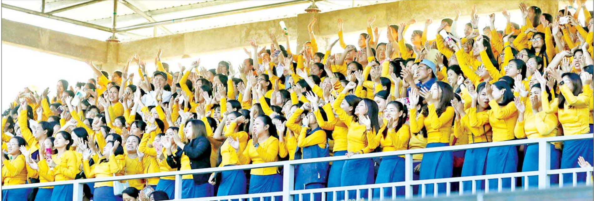
၂၀၂၄ ခုနှစ် ပဉ္စမအကြိမ် အမျိုးသားအားကစားပွဲတော် အားကစားပြိုင်ပွဲများကို လာရောက်ကြည့်ရှုအားပေးကြသူများကို တွေ့ရစဉ်။