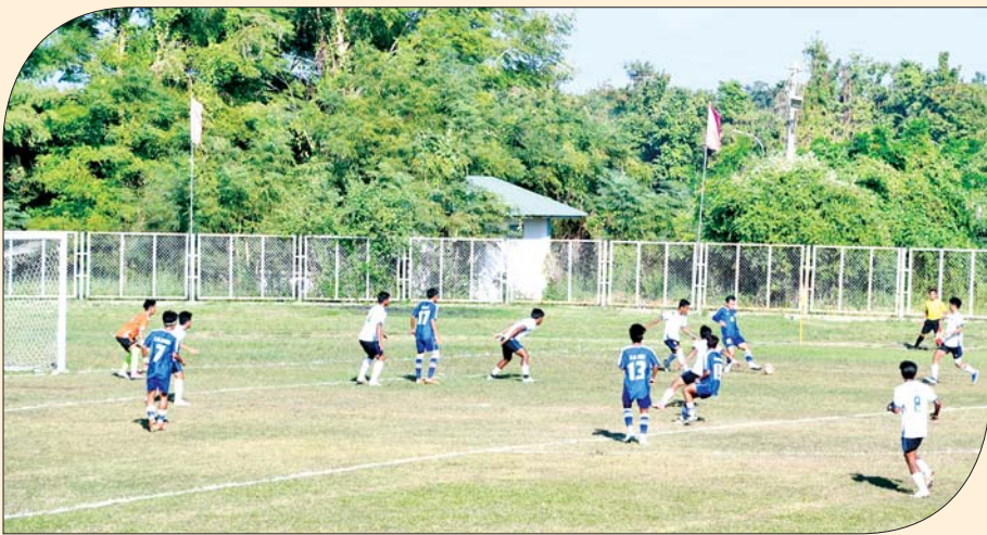
ဝန်ကြီးဌာနပေါင်းစုံ အမျိုးသားဘောလုံးပြိုင်ပွဲတွင် သမဝါယမနှင့် ကျေးလက်ဖွံ့ဖြိုးရေးဝန်ကြီးဌာန အသင်းနှင့် စီမံကိန်းနှင့်ဘဏ္ဍာရေးဝန်ကြီးဌာနအသင်းတို့ ယှဉ်ပြိုင်ကစားကြစဉ်။