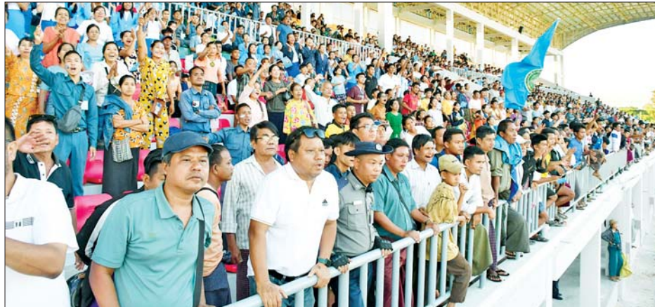
၂၀၂၄ ခုနှစ် ပဉ္စမအကြိမ် အမျိုးသားအားကစားပွဲတော် ပြည်နယ်နှင့် တိုင်းဒေသကြီးအဆင့်ပြိုင်ပွဲများတွင် လာရောက်ကြည့်ရှုအားပေးကြသူများကို တွေ့ရစဉ်။

ရှည်တနင်္သာရီတိုင်းဒေသကြီး၊ ဒုတိယဆုရရှိသည့် ကရင်ပြည်နယ်၊ ပူးတွဲတတိယဆုရရှိကြသည့် ရှမ်းပြည်နယ်နှင့် ပြည်ထောင်စုနယ်မြေ နေပြည်တော်အသင်းတို့မှ ပြိုင်ပွဲဝင်များအားလည်းကောင်း၊ အမျိုးသမီး ၅၆ ကီလိုတန်း အတိုက်ပြိုင်ပွဲတွင် ပထမဆုရရှိသည့် မန္တလေးတိုင်းဒေသကြီး၊ ဒုတိယဆုရရှိသည့် ရန်ကုန်တိုင်းဒေသကြီးနှင့် ပူးတွဲ တတိယဆုရရှိကြသည့် ကရင်ပြည်နယ်နှင့် ရှမ်းပြည်နယ်အသင်းတို့မှ ပြိုင်ပွဲဝင်များအားလည်းကောင်း တစ်ဦးချင်းဂုဏ်ပြုဆုတံဆိပ်နှင့် အမျိုးသားအားကစားပွဲတော် အထိမ်းအမှတ်အရုပ်များ ပေးအပ်ချီးမြှင့်ကြသည်။