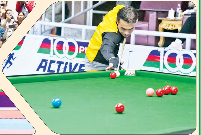
ပြည်နယ်နှင့် တိုင်းဒေသကြီး ဘီလီယက်/စနူကာပြိုင်ပွဲတွင် ပြိုင်ပွဲဝင်တစ်ဦး ယှဉ်ပြိုင်စဉ်။