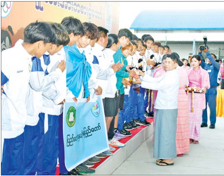
ပြည်ထောင်စုဝန်ကြီး ဦးမင်းနောင် ပြည်နယ်နှင့် တိုင်းဒေသကြီးအဆင့် အမျိုးသားဘောလုံးပြိုင်ပွဲတွင် ပထမဆုရရှိသည့် ပြည်ထောင်စုနယ်မြေ နေပြည်တော်အသင်းမှ ပြိုင်ပွဲဝင်များအား ဆုချီးမြှင့်စဉ်။

ယင်းနောက် ပြည်ထောင်စုဝန်ကြီး ဦးမျိုးသန့်က အမျိုးသမီးအသင်းလိုက် ခတပြိုင်ပွဲတွင် ပထမဆုရရှိသည့် မန္တလေးတိုင်းဒေသကြီး၊ ဒုတိယဆုရရှိသည့် ရန်ကုန်တိုင်းဒေသကြီး၊ ပူးတွဲ တတိယဆုရရှိသည့် ကယားပြည်နယ်နှင့် ရှမ်းပြည်နယ်အသင်းတို့မှ ပြိုင်ပွဲဝင်များအားလည်းကောင်း၊ အမျိုးသားအသင်းလိုက် ခတပြိုင်ပွဲတွင် ပထမဆုရရှိသည့် ရန်ကုန်တိုင်းဒေသကြီး၊ ဒုတိယဆုရရှိသည့် ရှမ်းပြည်နယ်၊ ပူးတွဲ တတိယဆုရရှိကြသည့် စစ်ကိုင်းတိုင်းဒေသကြီးနှင့် ကချင်ပြည်နယ်အသင်းတို့မှ ပြိုင်ပွဲဝင်များအားလည်းကောင်း တစ်ဦးချင်းဂုဏ်ပြုဆုတံဆိပ်နှင့် အမျိုးသားအားကစားပွဲတော် အထိမ်းအမှတ်အရုပ်များ ပေးအပ်ချီးမြှင့်ကြသည်။ ပြည်နယ်နှင့် တိုင်းဒေသကြီးအဆင့် အသက် ၂၁ နှစ်အောက် အမျိုးသားဘောလုံးပြိုင်ပွဲ ဆုချီးမြှင့်ပွဲအခမ်းအနားကို ရွှေကြာပင်အားကစားကွင်း၌ ကျင်းပရာ