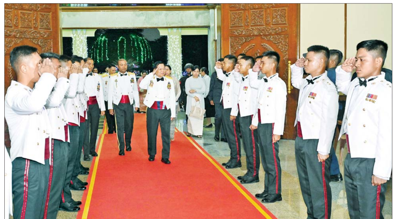
နိုင်ငံတော်စီမံအုပ်ချုပ်ရေးကောင်စီဥက္ကဋ္ဌ တပ်မတော်ကာကွယ်ရေးဦးစီးချုပ် ဗိုလ်ချုပ်မှူးကြီးမင်းအောင်လှိုင်၊ ဇနီး ဒေါ်ကြူကြူလှနှင့် ညစာစားပွဲအခမ်းအနားတက်ရောက်လာကြသူများအား ကျောင်းဆင်းဗိုလ်လောင်းများက ကြိုဆိုနှုတ်ဆက်စဉ်။

ဝန်ကြီးများ၊ ရန်ကုန်တိုင်းဒေသ ကြီးဝန်ကြီးချုပ်၊ ရန်ကုန်တိုင်း စစ်ဌာနချုပ်တိုင်းမှူး၊ တပ်မတော် ဆေးတက္ကသိုလ် ကျောင်းအုပ်ကြီး နှင့် မင်္ဂလာဒုံတပ်နယ်မှ တာဝန်ရှိ သူများ၊ ကျောင်းဆင်းဗိုလ်လောင်း များ၏ မိဘဆွေမျိုးများနှင့် ဖိတ်ကြားထားသည့် ဧည့်သည် တော်များ တက်ရောက်ကြ သည်။