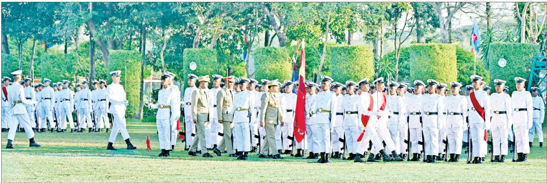
နိုင်ငံတော်စီမံအုပ်ချုပ်ရေးကောင်စီဥက္ကဋ္ဌ တပ်မတော်ကာကွယ်ရေးဦးစီးချုပ် ဗိုလ်ချုပ်မှူးကြီး သတိုးမဟာသရေစည်သူ သတိုးသီရိသုဓမ္မ မင်းအောင်လှိုင် ကျောင်းဆင်းဗိုလ်လောင်းတပ်ခွဲအား စစ်ဆေးစဉ်။