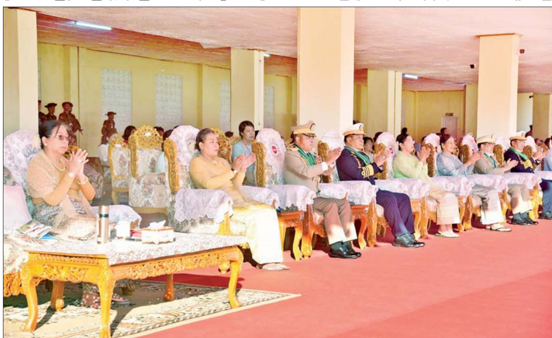
တပ်မတော်ဆေးတက္ကသိုလ် ဗိုလ်လောင်းသင်တန်းအမှတ်စဉ်(၂၅) သင်တန်းဆင်း ဂုဏ်ပြုစစ်ရေးပြအခမ်းအနားသို့ တက်ရောက်လာကြသူများကို တွေ့ရစဉ်။

များအဖြစ် အသိအမှတ်ပြုနေကြမည်ဖြစ်ကြောင်း၊ ထို့ကြောင့် အပင်ပန်းခံကြီးစားအားထုတ်ပြီး ရရှိလာခဲ့သည့် တပ်မတော်သားအရာရှိ ဆရာဝန် ဆေးမှူးဟူသည့် ဂုဏ်ပုဒ်ကို မထိခိုက်မပျက်စီးစေရေးအစစအရာရာ ကိုယ်တိုင်ထိန်းသိမ်းနေထိုင်သွားကြရန်လိုအပ်ကြောင်း၊ ထို့ပြင် တပ်မတော်သားဆရာဝန်များ ဖြစ်သည်နှင့်အညီ လိုအပ်လာပါက ခြေလျင်စစ်သည်များနှင့်အတူ နိုင်ငံတော် ကာကွယ်ရေးနှင့် လုံခြုံရေးအတွက် စစ်ဆင်ရေးတာဝန်များကိုပါ ထမ်းဆောင်ကြရမည်ဖြစ်သဖြင့် အမိန့်နာခံမှုကောင်းပြီး စစ်ပညာများကို အသုံးပြုတတ်သည့် စစ်ခေါင်းဆောင်များ ဖြစ်အောင် ကြိုးစားကြရန်လိုကြောင်း။