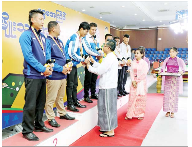
ပြည်ထောင်စုဝန်ကြီး ဦးကိုကိုလွင် ပြည်နယ်နှင့် တိုင်းဒေသကြီးအဆင့် ဘိုလီယက်နှင့် စနူကာပြိုင်ပွဲ ဘိုလီယက် နှစ်ယောက်တွဲပြိုင်ပွဲတွင် ပထမဆုရရှိသည့် ဧရာဝတီတိုင်းဒေသကြီးအသင်းမှ ပြိုင်ပွဲဝင်များအား ဆုချီးမြှင့်စဉ်။