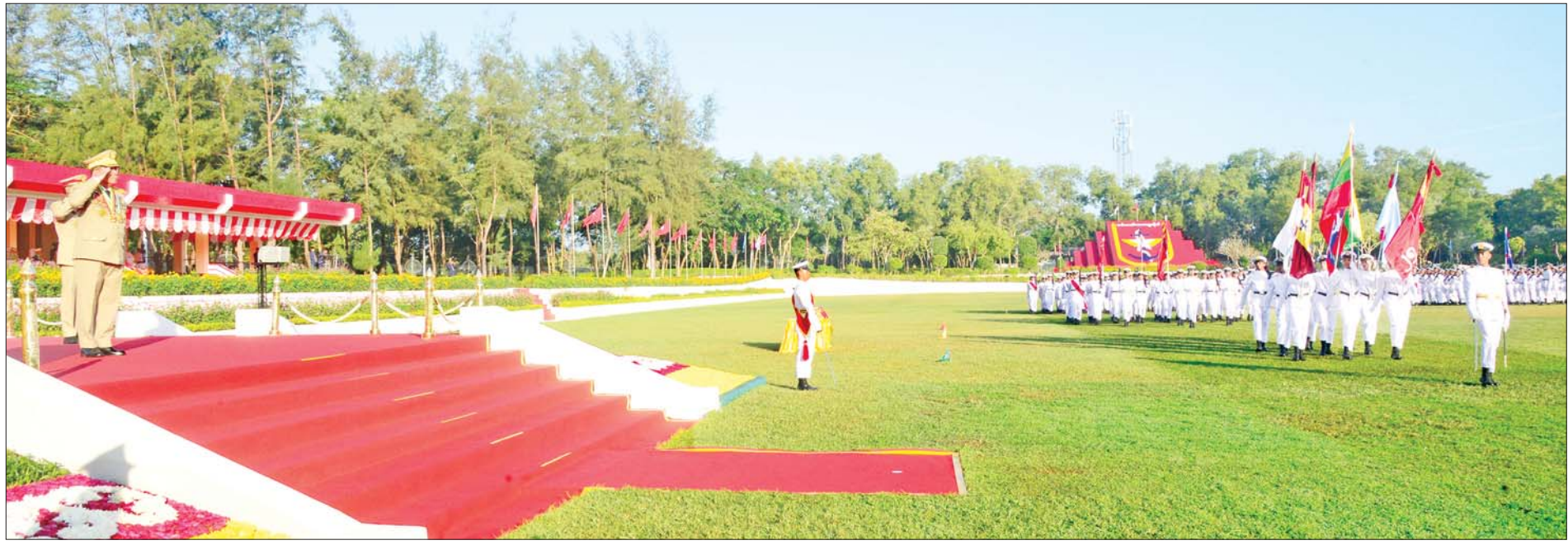
နိုင်ငံတော်စီမံအုပ်ချုပ်ရေးကောင်စီဥက္ကဋ္ဌ တပ်မတော်ကာကွယ်ရေးဦးစီးချုပ် ဗိုလ်ချုပ်မှူးကြီး သတိုးမဟာသရေစည်သူ သတိုးသီရိသုဓမ္မ မင်းအောင်လှိုင်အား ဗိုလ်လောင်းတပ်ခွဲများက အနွေးလျှောက်၊ အမြန်လျှောက်ဖြင့် ချီတက်အလေးပြုကြစဉ်။

( ၃-၉-၂၀၂၄ ရက်နေ့တွင် နိုင်ငံတော်စီမံအုပ်ချုပ်ရေးကောင်စီဥက္ကဋ္ဌ နိုင်ငံတော် ဝန်ကြီးချုပ် ဗိုလ်ချုပ်မှူးကြီး မင်းအောင်လှိုင် ရှမ်းပြည်နယ် အစိုးရအဖွဲ့ဝင်များ၊ ပြည်နယ်နှင့် ခရိုင်အဆင့် ဌာနဆိုင်ရာတာဝန်ရှိသူများအား ပြောကြားသည့် အမှာ စကားမှ ကောက်နုတ်ချက် )