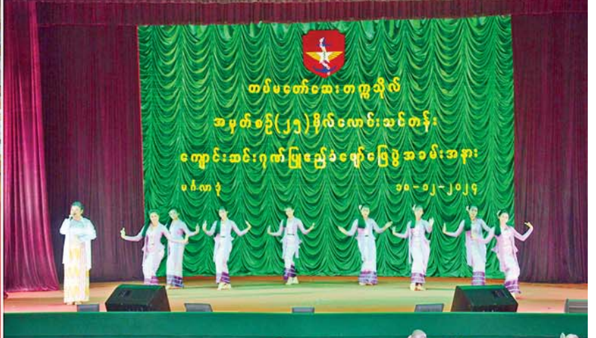
နိုင်ငံတော်စီမံအုပ်ချုပ်ရေးကောင်စီဥက္ကဋ္ဌ တပ်မတော်ကာကွယ်ရေးဦးစီးချုပ် ဗိုလ်ချုပ်မှူးကြီးမင်းအောင်လှိုင်နှင့် ဇနီး ဒေါ်ကြူကြူလှနှင့် အခမ်းအနားတက်ရောက်လာကြသူများ ကျောင်းဆင်းအရာရှိများနှင့်အတူ မြဝတီတေးဂီတအဖွဲ့၏ တေးသီချင်းများဖြင့် ဂုဏ်ပြုဖျော်ဖြေတင်ဆက်မှုများကို ကြည့်ရှုအားပေးကြစဉ်။