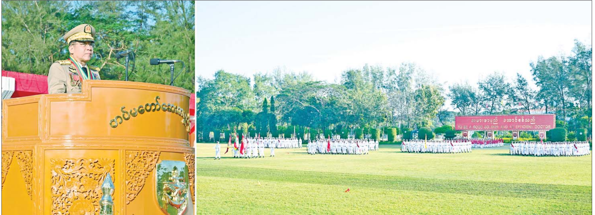
နိုင်ငံတော်စီမံအုပ်ချုပ်ရေးကောင်စီဥက္ကဋ္ဌ တပ်မတော်ကာကွယ်ရေးဦးစီးချုပ် ဗိုလ်ချုပ်မှူးကြီး သတိုးမဟာသရေစည်သူ သတိုးသီရိသုဓမ္မ မင်းအောင်လှိုင် တပ်မတော်ဆေးတက္ကသိုလ် ဗိုလ်လောင်းသင်တန်းအမှတ်စဉ်(၂၅) သင်တန်းဆင်း ဂုဏ်ပြုစစ်ရေးပြအခမ်းအနားတွင် မိန့်ခွန်းပြောကြားစဉ်။

နိုင်ငံတော်စီမံအုပ်ချုပ်ရေးကောင်စီဥက္ကဋ္ဌ တပ်မတော်ကာကွယ်ရေးဦးစီးချုပ် ဗိုလ်ချုပ်မှူးကြီး သတိုးမဟာသရေစည်သူ သတိုးသီရိသုဓမ္မ မင်းအောင်လှိုင် တပ်မတော်ဆေးတက္ကသိုလ် ဗိုလ်လောင်းသင်တန်းအမှတ်စဉ်(၂၅) သင်တန်းဆင်း ဂုဏ်ပြုစစ်ရေးပြအခမ်းအနားသို့ တက်ရောက်မိန့်ခွန်းပြောကြား လက်ရုံးရည်၊ နှလုံးရည်ပြည့်ဝသည့် ဆေးသိပ္ပံပညာရှင်အရာရှိကောင်းများအဖြစ် နိုင်ငံတော်၊ တပ်မတော်နှင့် တိုင်းရင်းသားပြည်သူလူထုအတွက် ကြိုးပမ်းဆောင်ရွက်