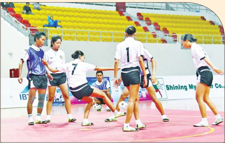
ပြည်နယ်နှင့် တိုင်းဒေသကြီး အမျိုးသမီး ရိုးရာခြင်းလုံးပြိုင်ပွဲတွင် မန္တလေး တိုင်းဒေသကြီးအသင်းမှ ပြိုင်ပွဲဝင်များ ယှဉ်ပြိုင်စဉ်။