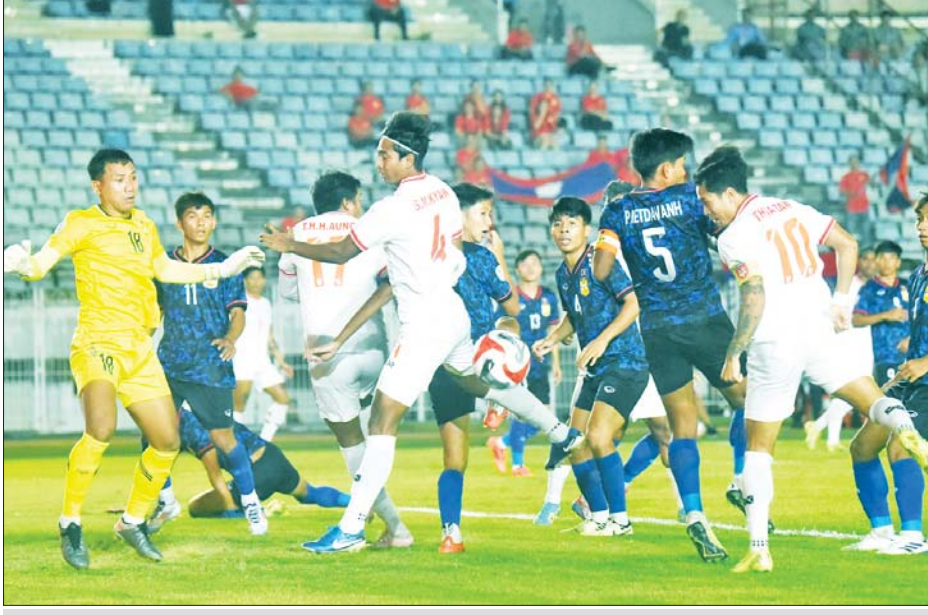
မြန်မာအသင်း လာအိုအသင်းဘက်သို့ ဂိုးသွင်းရန် ကြိုးပမ်းနေစဉ်။

သုဝဏ္ဏကွင်း၌ ကျင်းပသည့်ပွဲတွင် မြန်မာအသင်းက လာအိုအသင်းကို သုံးဂိုး-နှစ်ဂိုးဖြင့် အနိုင်ရခဲ့သည်။ မြန်မာအသင်းသည် ယခုပြိုင်ပွဲတွင် ပထမဆုံး နိုင်ပွဲရယူနိုင်ခဲ့ခြင်း ဖြစ်သလို နည်းပြချုပ်သစ် ဦးမျိုးလှိုင်ဝင်းအတွက် နိုင်ငံတကာပြိုင်ပွဲတွင် ပထမဆုံးရယူနိုင်သည့်နိုင်ပွဲလည်း ဖြစ်သည်။