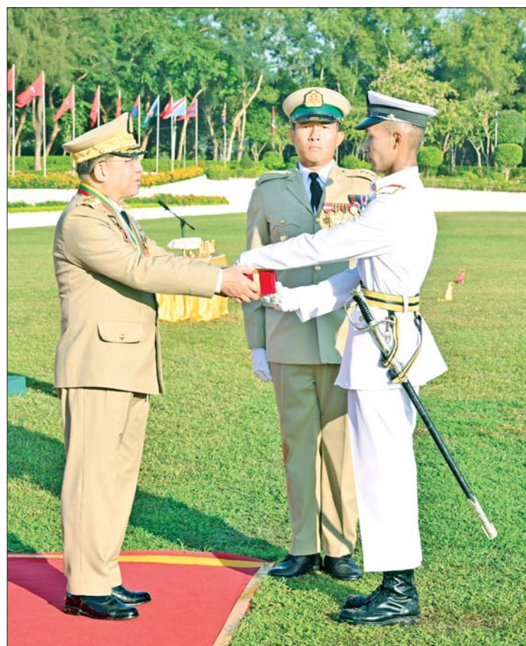
နိုင်ငံတော်စီမံအုပ်ချုပ်ရေးကောင်စီဥက္ကဋ္ဌ တပ်မတော်ကာကွယ်ရေးဦးစီးချုပ် ဗိုလ်ချုပ်မှူးကြီး သတိုးမဟာသရေစည်သူ သတိုးသီရိသုဓမ္မ မင်းအောင်လှိုင် တပ်မတော်ဆေးတက္ကသိုလ် ဗိုလ်လောင်းသင်တန်းအမှတ်စဉ်(၂၅)မှ စာပေထူးချွန်ဆရာရှိသူ ဗိုလ်လောင်း အောင်ကိုကိုထက်အား ဆုပေးအပ်ချီးမြှင့်စဉ်။

ဖြစ်ကြောင်း၊ လက်ရှိ မိမိတို့နိုင်ငံတွင်လည်း အမျိုးသားသိပ္ပံ၊ နည်းပညာနှင့် ဆန်းသစ်တီထွင်မှုကောင်စီကို ဖွဲ့စည်းထားပြီး ဆန်းသစ်တီထွင်မှုဆိုင်ရာ လုပ်ငန်းများကို ဆောင်ရွက်လျက်ရှိနေကြောင်း၊ ကျန်းမာရေးကဏ္ဍဆိုင်ရာတွင် နည်းပညာအသစ်များနှင့် ပြည့်သူ့ကျန်းမာရေးဝန်ဆောင်မှု၊ ကျန်းမာရေးနှင့် လူသားအရင်းအမြစ်ချိတ်ဆက်မှု၊ ဆေးပညာဆိုင်ရာ တက္ကသိုလ်အဆင့် ချိတ်ဆက်မှုများမှတစ်ဆင့် ကုသမှုနည်းပညာများ ပေါင်းစည်းခြင်းနှင့် အဆင့်မြင့်ကုသနည်းဖော်ထုတ်ခြင်း အစရှိသည်တို့ကို နည်းပညာလွှဲပြောင်းမှုစင်တာများနှင့် အသိပညာဖြန့်ဝေရေးစင်တာများမှ တစ်ဆင့် ချိတ်ဆက် ဆောင်ရွက်ပေးလျက်ရှိကြောင်း၊ ထို့ကြောင့် ပြောင်းလဲတိုးတက်လာသည့် နည်းပညာရပ်များ၊ ဆေးသိပ္ပံပညာရပ်များကို မျက်မြည်မပြတ်စေဘဲ နိုင်ငံတကာနှင့် ရင်ပေါင်တန်းနိုင်သည့် ဆေးသိပ္ပံပညာရှင်များ ဖြစ်အောင် တပ်မတော်ဆေးတက္ကသိုလ်က သင်ကြားပေးလိုက်သည့် ဆေးပညာရပ်များမှ တစ်ဆင့် အဆင့်မြင့်ဆေးပညာရပ်များကို ဆက်လက်ဆည်းပူး လေ့လာဆောင်ရွက်သွားကြရမည်ဖြစ်ကြောင်း။