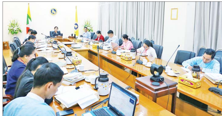
ctions Law) (မူကြမ်း) ကို ပြဋ္ဌာန်း စီမံကိန်းနှင့် ဘဏ္ဍာရေးဝန်ကြီး နိုင်ရန် ၂၀၁၈ ခုနှစ်မှစတင်၍ ညွှန်ကြားရေးဌာန၊ ဥပဒေရေးရာဝန်ကြီးဌာန၊ ဆောင်ရွက်ခဲ့ပါကြောင်း။ ပြည်ထောင်စု စာရားလွှတ်တော် ထိုသို့ ဆောင်ရွက်ရာတွင် ချုပ်ရုံး၊ စက်မှုဝန်ကြီးဌာန၊ ရင်းနှီး မြှုပ်နှံမှုနှင့် ကုမ္ပဏီများညွှန်ကြားမှု ဦးစီးဌာန၊ မြန်မာနိုင်ငံတော်ဗဟို ဘဏ်နှင့် မြန်မာနိုင်ငံဘဏ်များ အသင်းတို့မှ အဖွဲ့ဝင်များပါဝင်

နေပြည်တော် ဒီဇင်ဘာ ၁၈ ရွှေပြောင်းနိုင်သော ပစ္စည်းကို အာမခံထား၍ ငွေချေးခြင်းဆိုင်ရာ ဥပဒေ (Secured Transactions Law) အဋ္ဌမ(မူကြမ်း)နှင့်စပ်လျဉ်း သည့် အစည်းအဝေးကို ယနေ့ မွန်းလွဲပိုင်းတွင် မြန်မာနိုင်ငံတော် ဗဟိုဘဏ်၌ ကျင်းပသည်။ အစည်းအဝေးတွင် မြန်မာ နိုင်ငံတော် ဗဟိုဘဏ်ဥက္ကဋ္ဌ ဒေါ်သန်းသန်းဆွေက မြန်မာနိုင်ငံ တွင် ရွှေပြောင်းနိုင်သောပစ္စည်း ကို အာမခံထား၍ ငွေချေးနိုင်သည့် ဥပဒေအခြေခံတစ်ရပ် ရှိစေရန် အတွက် ရွှေပြောင်းနိုင်သောပစ္စည်း ကို အာမခံထား၍ ငွေချေးခြင်း ဆိုင်ရာဥပဒေ (Secured Transa-