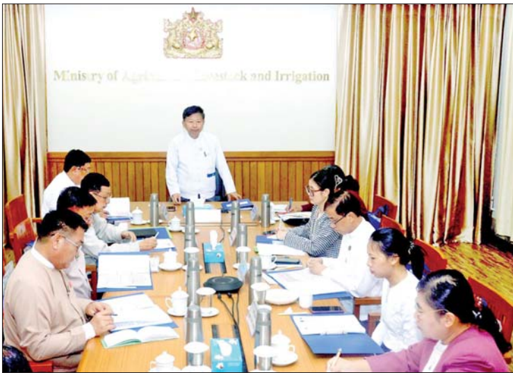
APTERR အစီအစဉ်ကို အရေးပေါ်သတ်မှတ်ချက်အဆင့်-၁ သတ်မှတ်ဆန်အား စီးပွားရေးနည်းလမ်းဖြင့် ဖြန့်ဝေခြင်း၊ အရေးပေါ်သတ်မှတ်ချက်အဆင့်-၂ သတ်မှတ်ဆန်ကို ကာလရှည်ချေးငွေအကူအညီဖြင့် ဖြန့်ဝေခြင်း၊ အရေးပေါ်သတ်မှတ်ချက်အဆင့်-၃ သို့လျှောက်ဆန်ကို အကူအညီဖြင့် ဖြန့်ဝေခြင်းတို့ ဆောင်ရွက်လျက်ရှိသည်။ APTERR Tier-3 အစီအစဉ်-၃(၂၀၂၄) ဖြင့် ကိုရီးယားသမ္မတနိုင်ငံမှ ဆန်တန်ချိန် ၃၀၀၀ နှင့် တရုတ်ပြည်သူ့သမ္မတနိုင်ငံမှ ငွေသားထောက်ပံ့မှုဖြင့် ဆန်တန်ချိန် ၅၀၀ တို့ကို လက်ခံသို့လျှောက်ဖြန့်ဖြူးခွင့်ရရှိမည်ဖြစ်ပြီး အဆိုပါအရန်ဆန်များကို ၂၀၂၅ ခုနှစ်အတွင်း မြန်မာနိုင်ငံ၌ သဘာဝဘေးအန္တရာယ်များ ကြုံတွေ့ရပါက ဘေးသင့်ပြည်သူများထံ APTERR ၏ အရန်ဆန်ဖြန့်ဖြူးခြင်းဆိုင်ရာ လုပ်ထုံးလုပ်နည်းများနှင့်အညီ ဖြန့်ဖြူးလှူဒါန်းသွားမည်ဖြစ်ကြောင်း သိရသည်။ သတင်းစဉ်