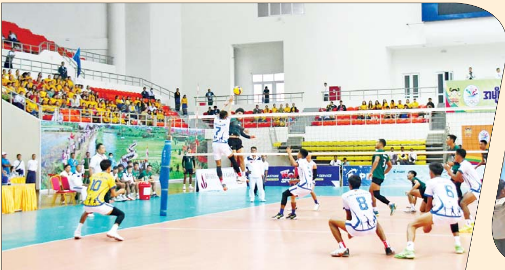
ဝန်ကြီးဌာနပေါင်းစုံ အမျိုးသားဘော်လီဘောပြိုင်ပွဲတွင် စီမံကိန်းနှင့်ဘဏ္ဍာရေးဝန်ကြီးဌာနအသင်းနှင့် ကာကွယ်ရေးဝန်ကြီးဌာနအသင်းတို့ ယှဉ်ပြိုင်ကစားနေမှုကို လာရောက်ကြည့်ရှုကြသူများအား တွေ့ရစဉ်။