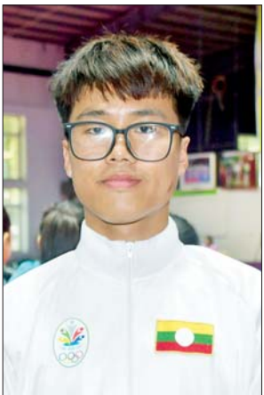
မောင်မင်းနိုင်ငြိမ်း