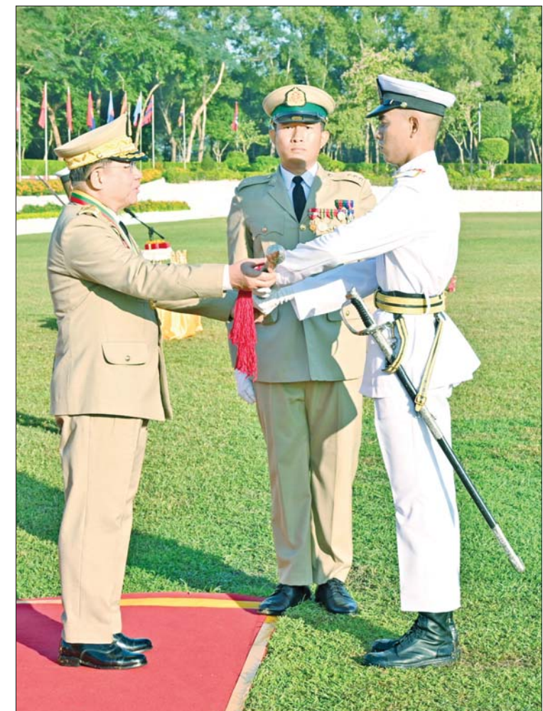
နိုင်ငံတော်စီမံအုပ်ချုပ်ရေးကောင်စီဥက္ကဋ္ဌ တပ်မတော်ကာကွယ်ရေးဦးစီးချုပ် ဗိုလ်ချုပ်မှူးကြီး သတိုးမဟာသရေစည်သူ သတိုးသီရိသုဓမ္မ မင်းအောင်လှိုင် တပ်မတော်ဆေးတက္ကသိုလ် ဗိုလ်လောင်းသင်တန်းအမှတ်စဉ်(၂၅)မှ အောင်စစ်သည် ဆုရရှိသူ ဗိုလ်လောင်း ကောင်းမြင့်မြတ်ထွန်းအား ဆုပေးအပ်ချီးမြှင့်စဉ်။

ယင်းနောက် နိုင်ငံတော်စီမံအုပ်ချုပ် ရေးကောင်စီဥက္ကဋ္ဌ တပ်မတော်ကာကွယ် ရေးဦးစီးချုပ် ဗိုလ်ချုပ်မှူးကြီး သတိုး မဟာသရေစည်သူ သတိုးသီရိသုဓမ္မ မင်းအောင်လှိုင်က တပ်မတော်ဆေး တက္ကသိုလ် ဗိုလ်လောင်းသင်တန်း အမှတ်စဉ်(၂၅)မှ အောင်စစ်သည်ဆုရရှိ သူ ဗိုလ်လောင်း ကောင်းမြင့်မြတ်ထွန်း၊ လေ့ကျင့်ရေးတူးချွန်ဆုရရှိသူ ဗိုလ်လောင်း သော်ဇင်ဦးနှင့် စာပေထူးချွန်ဆုရရှိသူ ဗိုလ်လောင်း အောင်ကိုကိုထက်တို့အား ဆုများပေးအပ်ချီးမြှင့်သည်။