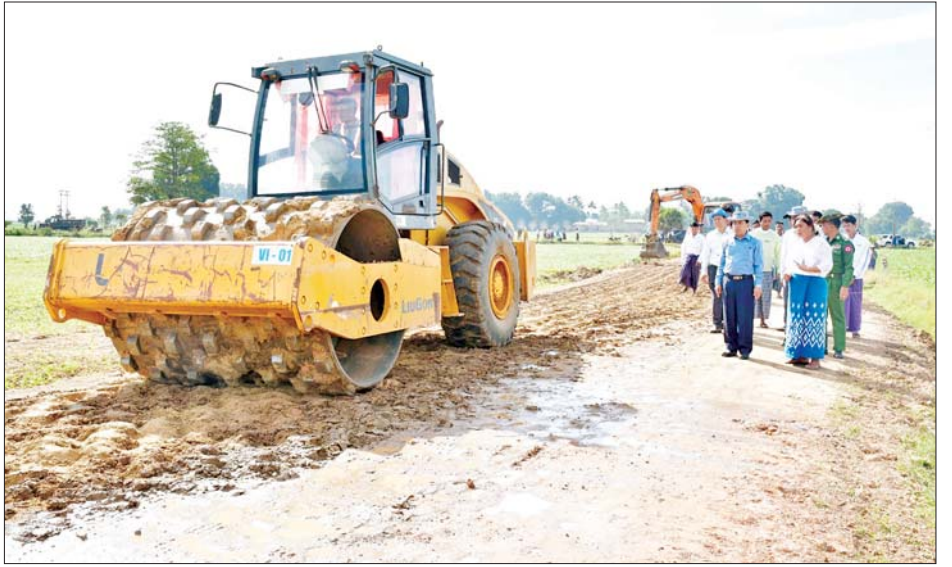
သို့သွားရောက်၍ လုပ်ငန်းလည်ပတ်ဆောင်ရွက်နေမှု ဆောင်ရွက်စေလိုကြောင်း မှာကြားကာ လိုအပ်သည်အခြေအနေများကို လှည့်လည်ကြည့်ရှုပြီး ထုတ်ကုန်များကို ပေါင်းစပ်ဆောင်ရွက်ပေးခဲ့ကြောင်း သိရသည်။ သို့သွားရောက်၍ လုပ်ငန်းလည်ပတ်ဆောင်ရွက်နေမှု ဆောင်ရွက်စေလိုကြောင်း မှာကြားကာ လိုအပ်သည်အခြေအနေများကို လှည့်လည်ကြည့်ရှုပြီး ထုတ်ကုန်များကို ပေါင်းစပ်ဆောင်ရွက်ပေးခဲ့ကြောင်း သိရသည်။ သတင်းစဉ်

ကြိုးစားဆောင်ရွက်ကြရေး မှာကြားပြီး နေပြည်တော်ကောင်စီဥက္ကဋ္ဌနှင့် တာဝန်ရှိသူများက ကျွဲ၊ နွား၊ ဝက်နှင့် ဆိတ်များ လွှဲပြောင်းသည့်မှတ်တမ်းလွှာများကို ပေးအပ်ကာ တက်ရောက်လာကြသည့် တောင်သူများ၏ တင်ပြချက်များအပေါ် လိုအပ်သည်များ ပေါင်းစပ်ညှိနှိုင်းဆောင်ရွက်ပေးသည်။ ထို့နောက် အေးချမ်းသာကျေးရွာနှင့် အောင်ချမ်းသာကျေးရွာချင်းဆက်လမ်းကို စက်ယန္တရားများဖြင့် ကျောက်ရောမြေခင်းခြင်းလုပ်ငန်း ဆောင်ရွက်နေမှုကို ကြည့်ရှုစစ်ဆေးပြီး လမ်းရေရည်တည်တံ့ခိုင်မြဲရေး၊ သတ်မှတ်စံချိန်စံညွှန်း ပြည့်မီစေရေးတို့ကို တာဝန်ရှိသူများအား မှာကြားကာ လိုအပ်သည်များ ပေါင်းစပ်ဆောင်ရွက်ပေးသည်။ ဆက်လက်၍ လယ်ဝေးမြို့နယ် ရုံးပင်ကျေးရွာရှိ ငြိမ်းချမ်းသာ အဆင့်မြင့်ဆန်စက်၊ ဆန်သန့်စင်စက်၊ စပါးအခြောက်ခံစက်နှင့် ဆန်ရောင်းဝယ်ရေး လုပ်ငန်း