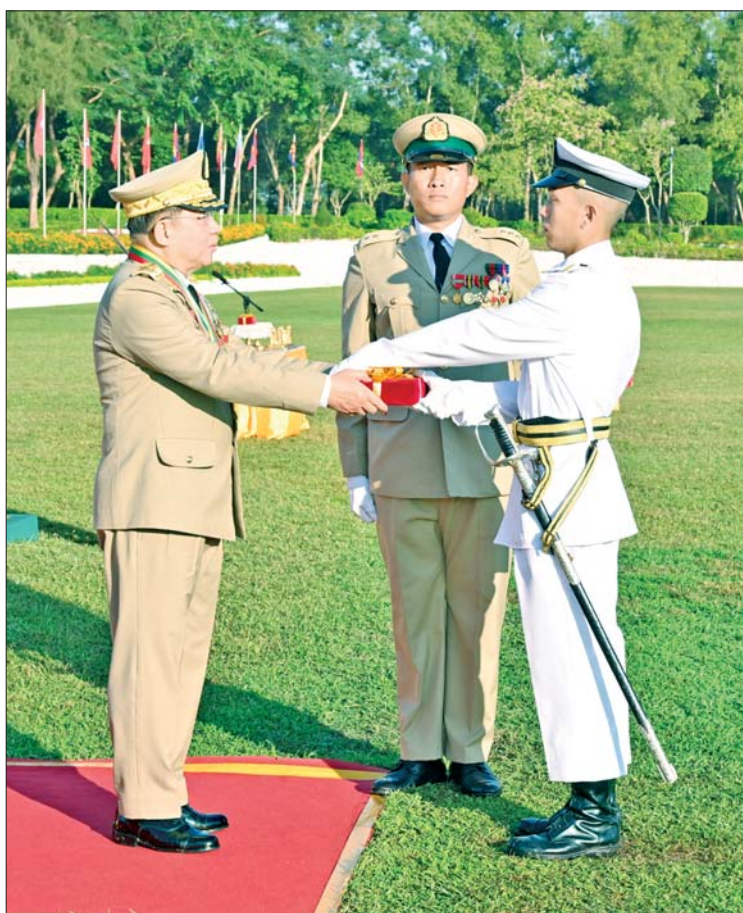
နိုင်ငံတော်စီမံအုပ်ချုပ်ရေးကောင်စီဥက္ကဋ္ဌ တပ်မတော်ကာကွယ်ရေးဦးစီးချုပ် ဗိုလ်ချုပ်မှူးကြီး သတိုးမဟာသရေစည်သူ သတိုးသီရိသုဓမ္မ မင်းအောင်လှိုင် တပ်မတော်ဆေးတက္ကသိုလ် ဗိုလ်လောင်းသင်တန်းအမှတ်စဉ်(၂၅)မှ လေ့ကျင့်ရေးထူးချွန်ဆရာရှိသူ ဗိုလ်လောင်း သော်ဇင်ဦးအား ဆုပေးအပ်ချီးမြှင့်စဉ်။

ယနေ့ခေတ်သည် သိပ္ပံနှင့်နည်းပညာ ခေတ်ဖြစ်သည်နှင့်အညီ ဆေးသိပ္ပံပညာ ရပ်နယ်ပယ်သည်လည်း တစ်နေ့တခြား တိုးတက်ပြောင်းလဲနေသည်ကို တွေ့ရှိရမည်ဖြစ်ကြောင်း၊ ဆန်းသစ်ပြောင်းလဲလာသည့် ကုထုံးနှင့် ဆေးဝါးကိရိယာအသစ်များ ပေါ်ပေါက်လာသကဲ့သို့ ထူးခြားဆန်းပြားသည့် ရောဂါဘယများကလည်း ဆေးပညာနယ်ပယ်ကို စိန်ခေါ်လျက်ရှိနေကြောင်း၊ ယင်းတို့ကို ရင်ဆိုင်ကျော်လွှားနိုင်ရေး ဆေးသိပ္ပံဆိုင်ရာ ပညာရပ်များနှင့် ပတ်သက်၍ သုတေသနပြုခြင်းအပါအဝင် တီထွင်ဆန်းသစ်မှုများကိုလည်း စဉ်ဆက်မပြတ် လေ့လာဆောင်ရွက်သွားကြရမည်