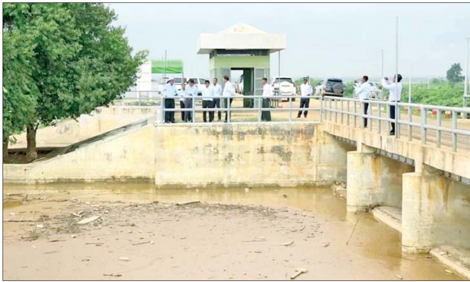
နည်းပါးစွာဖြင့် ရေထိန်းညှိ၍ စနစ်တကျစီမံခန့်ခွဲရန်၊ ရေလျှော့ကန်အထက်ပိုင်းရှိ နုန်းတား နှစ်ခုကို ပြန်လည်စစ်ဆေးရန်၊ ရေလျှော့ကန်အတွင်း သဲနုန်းတူးဖော်နိုင်ရေး တွက်ချက်တင်ပြရန် ဆွေးနွေးမှာကြား ခဲ့သည်။

နေပြည်တော် စက်တင်ဘာ ၂၃ စိုက်ပျိုးရေး၊ မွေးမြူရေးနှင့် ဆည်မြောင်းဝန်ကြီးဌာန ဒုတိယဝန်ကြီး ဦးဗိုလ်ဗိုလ်ကျော်သည် တာဝန်ရှိသူများနှင့်အတူ ယမန်နေ့နံနက်ပိုင်းက ကျီးနီကန်ဆည်ရေသောက်စနစ် ရေပေးတူးမြောင်းအချို့ ရေတိုက်စားသဖြင့် ဖြစ်ပေါ်လာသည့်ပျက်စီးမှုများကို ဆည်မြောင်းနှင့် ရေအသုံးချမှုစီမံခန့်ခွဲရေးဦးစီးဌာနက စက်ယန္တရားကြီးများအသုံးပြု၍ ပြန်လည်ပြုပြင်ဆောင်ရွက်နေမှု၊ တစ်ဖန် ရေတိုက်စားကြံ့ခိုင်မှု၊ အရန်ရေပိုလှုံ့နေရာကို ယာယီဆောင်ရွက်ထားရှိမှုနှင့် ရေလျှော့ကန်အတွင်း သဲနုန်းပို့ချမှု အခြေအနေများကို ကွင်းဆင်းစစ်ဆေးသည်။