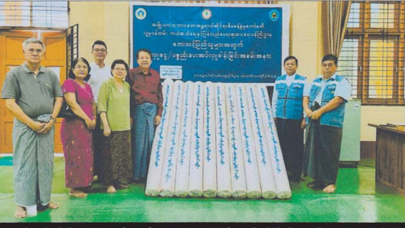
“ရာဂီ မုန်တိုင်း ခဏသင့်ပြည်သူများအတွက် ကျပ်သိန်း(၅၀၀) ကျော်တန်ဖိုးရှိ မိုးခရကာပျင်များလျှော့ချခြင်း”