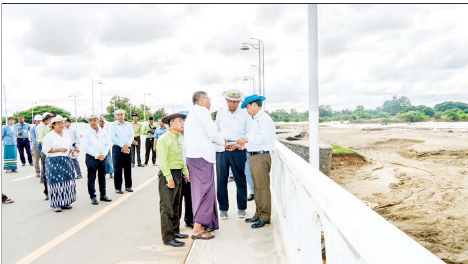
ဦးစွာ ဆင်သေချောင်းတံတား (ပုပွားကုန်း)၊ တံတားထိပ်ခုံ နှင့် ချဉ်းကပ်လမ်းတို့၏ မူလ လမ်းဦးစီးဌာနမှ ညွှန်ကြားရေးမှူး ပျက်စီးမှု၊ ပြန်လည်ပြုပြင်ဆောင် ခေါ်နှယ်နီထွန်းက ဆင်သေချောင်း ရွက်ပြီးစီးမှုနှင့် ဆက်လက်ဆောင် ရွက်မည့် လုပ်ငန်းအခြေအနေ၊ ပုပွားကုန်းတံတားနှင့် ဒိုးပင်ခုံး တံတား နှစ်စင်းအကြား လမ်းတာ ပေါင် မူလပျက်စီးမှုများ ပြန်လည်

နေပြည်တော် စက်တင်ဘာ ၂၃ ဆောက်လုပ်ရေးဝန်ကြီးဌာန ပြည်ထောင်စုဝန်ကြီး ဦးမျိုးသန့် သည် နေပြည်တော် စည်ပင် သာယာရေးကော်မတီ ဥက္ကဋ္ဌ မြို့တော်ဝန် ဦးသန်းထွန်းဦး၊ ဒုတိယမြို့တော်ဝန်၊ တာဝန်ရှိသူ များနှင့်အတူ ယနေ့တွင် သဘာဝ ဘေးကြောင့် ပျက်စီးခဲ့သော နေပြည်တော် စည်ပင်သာယာရေး ကော်မတီ၏ လမ်း၊ တံတားများ ယာယီပြင်ဆင်ပြီးစီးသည့် အခြေ အနေ၊ အခိုင်အမာပြင်ဆင်တည် ဆောက်မည့် အစီအမံနှင့် ဆင်သေ ချောင်း၏ ပြင်ဆင်ထိန်းသိမ်းခြင်း ဆောင်ရွက်ရမည့် အခြေအနေ တို့ကို ကွင်းဆင်းကြည့်ရှုစစ်ဆေး သည်။