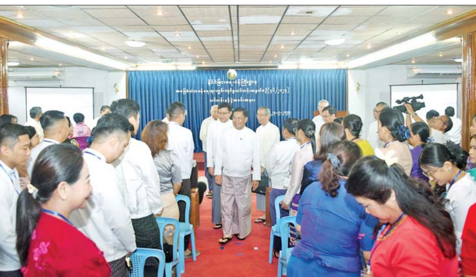
ဆရာမကြီးများ၊ သင်တန်းသား သင်တန်းသူများ တက်ရောက်ကြသည်။

အခမ်းအနားများသို့ နိုင်ငံခြားရေးဝန်ကြီးဌာန ဒုတိယဝန်ကြီး၊ အမြဲတမ်းအတွင်းဝန်၊ ပြည်ထောင်စုဝန်ကြီးရုံးနှင့် ဦးစီးဌာနများမှ ညွှန်ကြားရေးမှူးချုပ်များနှင့် တာဝန်ရှိသူများ၊ အငြိမ်းစားသံအမတ်ကြီးများ၊ ဝါရင့်သံတမန်များ၊ ဘာသာရပ်ဆိုင်ရာကျွမ်းကျင်သူများ၊ တက္ကသိုလ်များမှ ပါမောက္ခဆရာကြီး၊