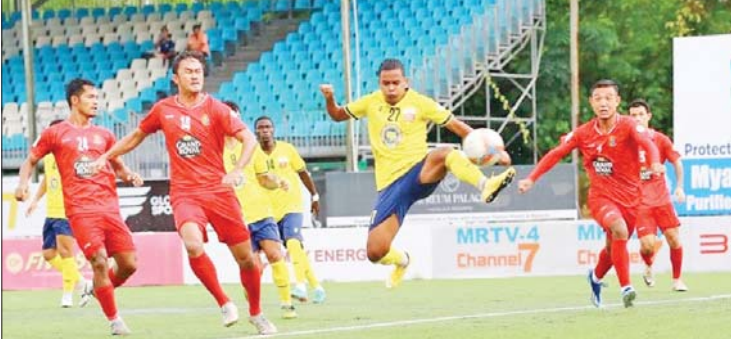
ဟံသာဝတီယူနိုက်တက်အသင်းနှင့် ရခိုင်ယူနိုက်တက်အသင်းတို့ ယှဉ်ပြိုင်နေစဉ်။

ပြီဖြစ်သော်လည်း မိုးသည်းထန်စွာရွာသွန်းမှုကြောင့် ရွှေ့ဆိုင်းထားရသည့် ရတနာပုံ အသင်းနှင့် အား/ကာသိပွဲအသင်းတို့၏ လက်ကျန် ဒုတိယပိုင်း ၄၅ မိနစ်ကို စက်တင်ဘာ ၂၆ ရက်တွင် သုဝဏ္ဏကွင်း၌ ပြန်လည်ကျင်းပမည်ဖြစ်သည်။ ပထမ အကျော့အပြီးတွင် ရှမ်းယူနိုက်တက် အသင်းက ၃၁ မှတ်ဖြင့် ရာသီဝက်ချန်ပီယံ ဖြစ်ခဲ့ပြီး ဟံသာဝတီအသင်းက ၂၈ မှတ်၊ ရန်ကုန်ယူနိုက်တက်အသင်းက ၂၇ မှတ်၊ ဒဂုံစတား ယူနိုက်တက်အသင်းက ၂၃ မှတ်၊ ရတနာပုံအသင်းက ၁၇ မှတ်၊ မဟာ ယူနိုက်တက်အသင်းက ၁၆ မှတ်၊ အား/ ကာသိပွဲအသင်းက ၁၃ မှတ်၊ Dagon Port အသင်းက ၁၂ မှတ်၊ သစ္စာအားမာန် အသင်းက ၃ နှစ်မှတ်၊ ဧရာဝတီယူနိုက်တက် အသင်းက ငါးမှတ်၊ မြဝတီအသင်းက လေးမှတ်၊ ရခိုင်ယူနိုက်တက်အသင်းက နှစ်မှတ် ရရှိထားသည်။ သတင်း-ကိုညီလေး