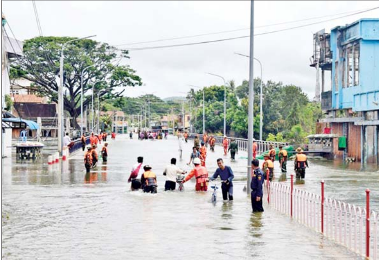
ရေဘေးသင့်ပြည်သူများအား ကူညီကယ်ဆယ်ရေးလုပ်ငန်းများ ဆောင်ရွက်ပေးစဉ်။

★ ရှေ့ဖူးမှ ထို့ပြင် ယာယီရေဘေးရှောင်စခန်းများတွင် ရေဘေးသင့်ပြည်သူများအား ကျန်းမာရေးအဖွဲ့များက လိုအပ်သည့် ကျန်းမာရေး စောင့်ရှောက်မှု လုပ်ငန်းများနှင့် ကျန်းမာရေး အသိပညာပေးဟောပြောဆွေးနွေးခြင်းများ ဆောင်ရွက်ပေးပြီး တပ်မတော် (ကြည်း၊ ရေ၊ လေ) မိသားစုများ၊ ဌာနဆိုင်ရာများ၊ အသင်းအဖွဲ့များနှင့် အလှူရှင်များက ထောက်ပံ့ပစ္စည်းများ၊ အဝတ် အထည်များ၊ အသုံးအဆောင်ပစ္စည်းများ၊ စားသောက်ဖွယ်ရာများနှင့် အလှူငွေများကို အားတက်သရောပေးအပ်လှူဒါန်းခြင်းနှင့် သံဃာတော်များအား လှူဖွယ်ပစ္စည်းများ ဆက်ကပ်လှူဒါန်းခြင်းများ ဆောင်ရွက်ပေးလျက်ရှိသည်။ ယနေ့တွင် ကာကွယ်ရေးဦးစီးချုပ်ရုံး(ကြည်း) မှ ဒုတိယဗိုလ်ချုပ်ကြီး ဖုန်းမြတ်၊ နေပြည်တော် တိုင်းစစ်ဌာနချုပ် တိုင်းမှူး ဗိုလ်ချုပ်စိုးမင်းနှင့်