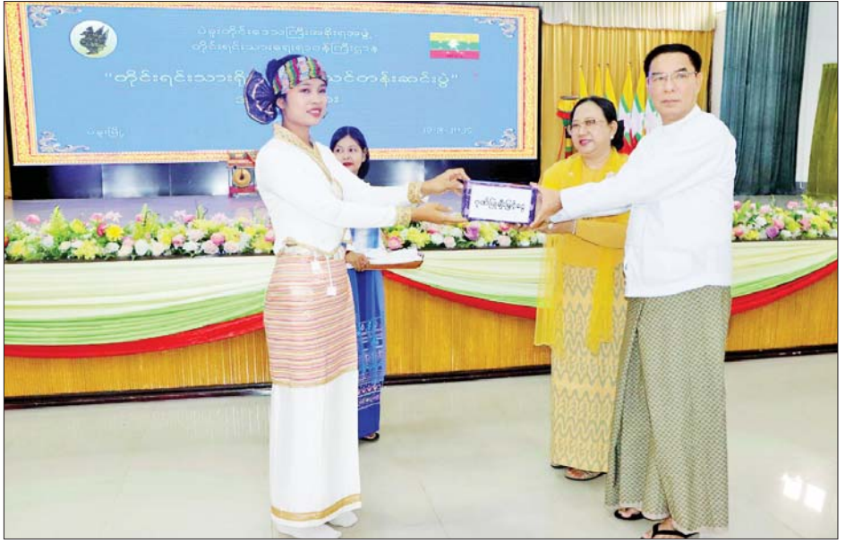
ရိုးရာ အက၊ ရှမ်းတိုင်းရင်းသားရိုးရာသင်ကြားအက သား အကအဖွဲ့များ အား ဂုဏ်ပြုချီးမြှင့်ငွေပေးအပ် တို့ဖြင့် ဧည့်ခံဖျော်ဖြေတင်ဆက်ကြသည်။ ထို့နောက် ခွဲကြောင်း သိရသည်။ တိုင်းဒေသကြီးဝန်ကြီးချုပ်နှင့်ဇနီးတို့က တိုင်းရင်း တိုင်းဒေသကြီး(ပြန်/ဆက်)

တိုးတက်ရေးအတွက် အလေးထားဆောင်ရွက်ပေးလျက်ရှိကြောင်း၊ ယခုသင်တန်း ဖွင့်လှစ်ပေးခဲ့ခြင်းကြောင့် မိမိတို့တိုင်းရင်းသားများ၏ရိုးရာအကများကို မပျောက်ပျက်အောင် ထိန်းသိမ်းစောင့်ရှောက်နိုင်ခြင်း၊ တိုင်းရင်းသားလူငယ်များအနေဖြင့် မိမိတို့ရိုးရာအကများကို စဉ်ဆက်မပြတ်စေရန် သင်ကြားပေးနိုင်ခြင်း စသည့်အကျိုးကျေးဇူးများရရှိခဲ့ကြောင်း၊ သင်တန်းသား သင်တန်းသူများအနေဖြင့် မိမိတို့၏ရိုးရာအကများကို လက်ဆင့်ကမ်းသယ်ဆောင်ပြီး ပဲခူးတိုင်းဒေသကြီး၏ နေထိုင်မှုအခမ်းအနားများ၊ ဖျော်ဖြေရေးလုပ်ငန်းများတွင် တိုင်းရင်းသားများအားလုံး ချစ်ခင်ရင်းနှီးစွာ ပူးပေါင်းပါဝင်ဆောင်ရွက်နိုင်ကြမည်ဖြစ်ကြောင်း အမှာစကားပြောကြားသည်။ ထို့နောက် သင်တန်းသား သင်တန်းသူများက ချင်းတိုင်းရင်းသားရိုးရာအက၊ ကရင်တိုင်းရင်းသား