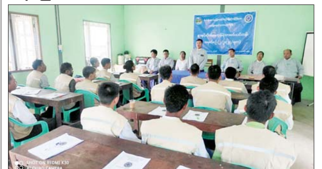
တင်ဝင်းတင်

ရန်ကုန် စက်တင်ဘာ ၂၃ သန်လျင်ခရိုင် မွေးမြူရေးနှင့် ကုသရေးဦးစီးဌာန နွားနှင့်ဆိတ် မေထုန်မဲ့သားစပ်သင်တန်း(၂/၂၀၂၄) ဖွင့်ပွဲကို ယနေ့နံနက် ၉ နာရီတွင် သန်လျင်မြို့ရှိ ခရိုင်မွေးမြူရေးနှင့် ကုသရေးဦးစီးဌာန သင်တန်းခန်းမ၌ ကျင်းပသည်။ ဦးစွာ ရန်ကုန်တိုင်းဒေသကြီး မွေးမြူရေးနှင့် ကုသရေးဦးစီးဌာန တိုင်းဒေသကြီးဦးစီးမှူး ဒေါက်တာအောင်မြင်ဟန်က အမှာစကား ပြောကြားသည်။ ထို့နောက် မွေးမြူရေးနှင့် ကုသရေးဦးစီးဌာန ဒုတိယ တိုင်းဦးစီးမှူး ဒေါက်တာမင်းညွန့်ဦးက သင်တန်းဖွင့်လှစ်ရခြင်း ရည်ရွယ်ချက်ကို ရှင်းလင်းပြောကြားသည်။ အဆိုပါသင်တန်းသို့ သန်လျင်၊ ကျောက်တန်း၊ သုံးခွ၊ ခရမ်း၊ တံတားမြို့တို့မှ သင်တန်းသား ၂၅ ဦး တက်ရောက်ကြပြီး သင်တန်း ကာလမှာ စက်တင်ဘာ ၂၃ ရက်မှ ၂၇ ရက်ထိ ဖွင့်လှစ်မည်ဖြစ်ကြောင်း သိရသည်။