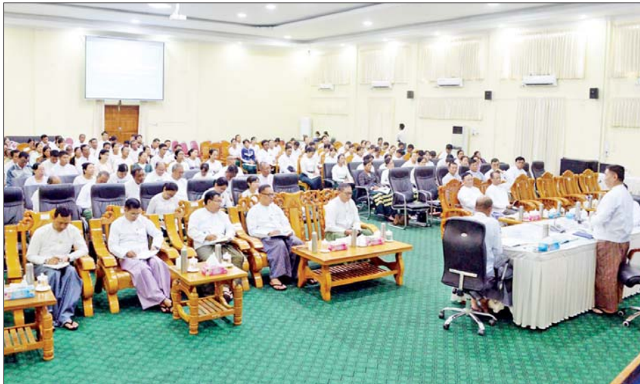
ဖွင့်လှစ်နိုင်ရေး ဆောင်ရွက်ကြရန်၊ ကယ်ဆယ်ရေး စခန်းများတွင်ရောက်ရှိနေပြီး နှစ်ဝက်စာမေးပွဲတွင် ဝင်ရောက်ဖြေဆိုနိုင်ခြင်းမရှိသည့် ကျောင်းသား ကျောင်းသူများကို အစားထိုးပြန်လည်ဖြေဆိုနိုင်ရေး စီစဉ်ပေးရန်၊ ကျောင်းဆောင်နှင့် စာသင်ခန်းများ သန့်ရှင်းရေး၊ နန်းများဆေးကြောရေး၊ သောက်ရေ သုံးရေရရှိရေး၊ သန့်စင်ခန်းများ သန့်ရှင်းရေးနှင့် ကျောင်းသား ကျောင်းသူများ ပြန်လည်ကျောင်းတက်

နေပြည်တော် စက်တင်ဘာ ၂၃ ပြည်ထောင်စုနယ်မြေ နေပြည်တော်နှင့် တိုင်းဒေသကြီး၊ ပြည်နယ်များရှိ ရေဘေးသင့်ကျောင်းများ အမြန်ဆုံးပြန်လည်ဖွင့်လှစ်နိုင်ရေး လုပ်ငန်းညှိနှိုင်းအစည်းအဝေးကို ယနေ့မွန်းလွဲပိုင်းတွင် နေပြည်တော် ပညာရေးဝန်ကြီးဌာန ရုံးအမှတ်(၁၃) ရှိ အစည်းအဝေးခန်းမ၌ ကျင်းပရာ ပညာရေးဝန်ကြီးဌာန ပြည်ထောင်စုဝန်ကြီး ဒေါက်တာညွန့်ဖေ၊ ဒုတိယဝန်ကြီးများဖြစ်ကြသည့် ဒေါက်တာဇော်မြင့်နှင့် ဒေါက်တာမိုးဇော်ထွန်း၊ ညွှန်ကြားရေးမှူးချုပ်များ၊ ဒုတိယအမြဲတမ်းအတွင်းဝန်များ၊ ပြည်ထောင်စုနယ်မြေ နေပြည်တော်နှင့် ရေဘေးသင့်ခဲ့သောဒေသများမှ ခရိုင်ပညာရေးမှူးများ၊ မြို့နယ်ပညာရေးမှူးများ၊ ကျောင်းအုပ်ကြီးများနှင့် ဆရာ ဆရာမများ တက်ရောက်ကြသည်။