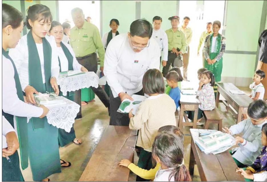
ရိုကြောင်း၊ ရေဘေးဒဏ်သင့်ခဲ့သော ဆရာ ဆရာမ များကိုစီစဉ်ပြီး တာဝန်ရှိသူများအနေဖြင့် အဆင်ပြေ စေရေး ဆောင်ရွက်ပေးရန်လိုကြောင်း၊ ဆရာ ဆရာမ များနှင့် ကျောင်းသား ကျောင်းသူများ၏ အခက်အခဲ

လွိုင်ကော် စက်တင်ဘာ ၂၃ ကယားပြည်နယ်အစိုးရအဖွဲ့က လွိုင်ကော်မြို့နယ်အတွင်း ဘီလူးချောင်းမြေငှက်တက်မှုကြောင့် ဖြစ်ပေါ်ခဲ့သော ရေဘေးဒဏ်သင့်ခဲ့သည့် ကျောင်းသား ကျောင်းသူများအား ယာယီ ရေဘေးကယ်ဆယ်ရေးစခန်းများဖွင့်လှစ်၍ ကူညီ ဆောင်ရွက်လျက်ရှိပြီး အဆိုပါစခန်းများတွင် နေထိုင် နေသော ကျောင်းသား ကျောင်းသူများ၏ ပညာရေး နှောင့်နှေးမှုမရှိစေရေးအတွက်လည်း စီစဉ်ဆောင် ရွက်ပေးလျက်ရှိရာ ပြည်နယ်ဝန်ကြီးချုပ် ဦးဇော်မျိုး တင်၊ ပြည်နယ်အစိုးရအဖွဲ့ဝင်များနှင့် တာဝန်ရှိသူများ သည် ယနေ့နံနက်ပိုင်းက လွိုင်ကော်မြို့ အမှတ်(၂) အခြေခံပညာ အလယ်တန်းကျောင်းသို့ ရောက်ရှိပြီး ပြည်နယ်ပညာရေးမှူး၊ ကျောင်းအုပ်ဆရာမကြီးများ၊ ဆရာ ဆရာမများနှင့် တွေ့ဆုံ၍ ပြည်နယ်ဝန်ကြီးချုပ် က ရေးကြီးရေလျှံမှုကြောင့် ကျောင်းများအားယာယီ ပိတ်ထားသော်လည်း ပညာသင်ကြားနေသည့် ကျောင်းသား ကျောင်းသူများ ကျောင်းမပျက်စေရန် အခြားစာသင်ကျောင်းများနှင့် တွဲဖက်သင်ကြားနိုင် ရန်တာဝန်ရှိသူများက ကြီးကြပ်ဆောင်ရွက်ပေးလျက်