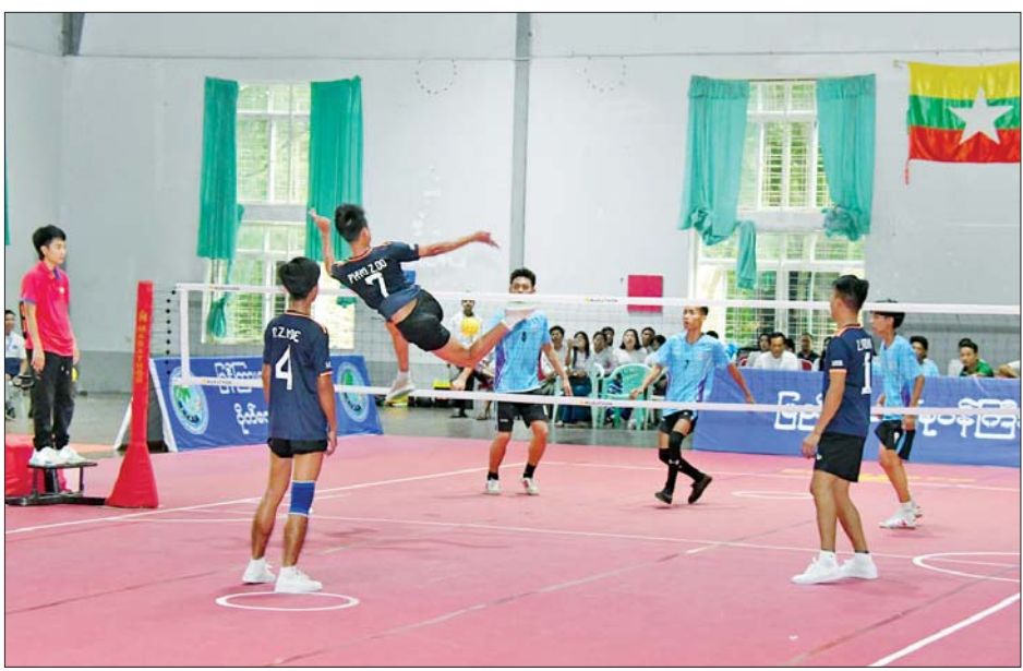
ရုပ်မြင်သံကြား၊ ပြန်ကြားရေးနှင့် ပြည်သူ့ဆက်ဆံရေး ဦးစီးဌာန၊ ပုံနှိပ်ရေးနှင့် ထုတ်ဝေရေးဦးစီးဌာန၊ မီဒီယာ ဖွံ့ဖြိုးတိုးတက်ရေးဦးစီးဌာနနှင့် သတင်းနှင့် စာနယ် ဇင်းလုပ်ငန်းတို့မှ စုစုပေါင်း အသင်းခြောက်သင်း ပါဝင်ယှဉ်ပြိုင်ကြခြင်းဖြစ်ရာ ဆီမီးပိုင်နယ်ပွဲစဉ် များကို စက်တင်ဘာ ၂၄ ရက်တွင် သတင်းနှင့်စာနယ် ဇင်းလုပ်ငန်းအသင်းနှင့် ပြန်ကြားရေးနှင့် ပြည်သူ့ ဆက်ဆံရေးဦးစီးဌာနအသင်းတို့သည်လည်းကောင်း၊ မီဒီယာ ဖွံ့ဖြိုးတိုးတက်ရေးဦးစီးဌာနအသင်းနှင့် မြန်မာ့အသံနှင့် ရုပ်မြင်သံကြားအသင်းတို့သည် လည်းကောင်း ဆက်လက်ယှဉ်ပြိုင် ကစားကြမည် ဖြစ်ကြောင်းသိရသည်။ သတင်းစဉ်

ရုပ်မြင်သံကြားအသင်းက ပြန်ကြားရေးနှင့် ပြည်သူ့ ဆက်ဆံရေးဦးစီးဌာနအသင်းကို နှစ်ပွဲပြတ်ဖြင့် လည်းကောင်း၊ သတင်းနှင့် စာနယ်ဇင်းလုပ်ငန်း အသင်းက မီဒီယာဖွံ့ဖြိုးတိုးတက်ရေးဦးစီးဌာန အသင်းကို နှစ်ပွဲပြတ်ဖြင့်လည်းကောင်း အနိုင်ရရှိကြ သည်။ မွန်းလွဲပိုင်းတွင် အုပ်စုအဆင့်ပွဲစဉ်များဆက်လက် ကျင်းပရာ ပြန်ကြားရေးနှင့် ပြည်သူ့ဆက်ဆံရေးဦးစီး ဌာနအသင်းက ပြန်ကြားရေးဝန်ကြီးရုံးအသင်းကို နှစ်ပွဲတစ်ပွဲဖြင့်လည်းကောင်း၊ သတင်းနှင့်စာနယ်ဇင်း အသင်းက ပုံနှိပ်ရေးနှင့် ထုတ်ဝေရေးဦးစီးဌာန အသင်းကို နှစ်ပွဲတစ်ပွဲဖြင့်လည်းကောင်း၊ မြန်မာ့ အသံနှင့် ရုပ်မြင်သံကြားအသင်းက ပြန်ကြားရေး ဝန်ကြီးရုံးအသင်းကို နှစ်ပွဲပြတ်ဖြင့် လည်းကောင်း အနိုင်ရရှိကြသည်။