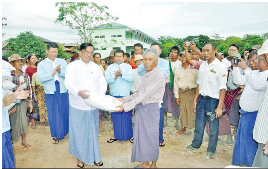
အားပေးသည်။ ထို့နောက် ပြည်ထောင်စုဝန်ကြီးသည် ရေဘေးသင့်ပြည်သူများ၏ အုပ်ချုပ်မှုဆိုင်ရာ ကိစ္စရပ်များကို ဆောင်ရွက်ပေးနေသည့် တာဝန်ရှိသူများနှင့်တွေ့ဆုံ၍ သတင်းစဉ်

နေပြည်တော် စက်တင်ဘာ ၂၃ စက်မှုဝန်ကြီးဌာန ပြည်ထောင်စုဝန်ကြီး ဒေါက်တာချာလီသန်းသည် ဝန်ကြီးဌာန သဘာဝဘေးအန္တရာယ်ဆိုင်ရာ စီမံခန့်ခွဲရေးအဖွဲ့ဝင်များ၊ တာဝန်ရှိသူများနှင့်အတူ ယနေ့နံနက်ပိုင်းတွင် နေပြည်တော် ကောင်စီနယ်မြေအတွင်း မိုးအဆက်မပြတ်ရွာသွန်းပြီး ရေကြီးရေလျှံမှုများကြောင့် ရေဘေးသင့်ခဲ့သည့် အိမ်ထောင်စု ၅၈၅ စု၊ လူဦးရေ ၅၀၀ ခန့်ရှိ လယ်ဝေးမြို့နယ် ပိတောက်ချောင်ကျေးရွာအုပ်စု ကွမ်းခြံကျေးရွာသို့ သွားရောက်ပြီး ပြည်သူများနှင့် တွေ့ဆုံ၍ အားပေးစကားပြောကြားသည်။ ထိုသို့တွေ့ဆုံစဉ် ရေကြီးရေလျှံဖြစ်ပေါ်ခဲ့မှု၊ ပျက်စီးဆုံးရှုံးခဲ့မှု၊ ကျန်းမာရေးကိစ္စရပ်များ၊ ပြန်လည်ထူထောင်ရေးလုပ်ငန်းစဉ်များ ဆောင်ရွက်နေမှုတို့ကို ဆွေးနွေးမေးမြန်းပြီး ကျေးရွာရှိ အခြေခံပညာအထက်တန်းကျောင်းခွဲ ပြန်လည်ဖွင့်လှစ်နိုင်ရေးအတွက် သန့်ရှင်းရေးပြုလုပ်နေမှု၊ ရေကောင်းရေးသန့်များရရှိရေး ဆောင်ရွက်ပေးနေမှုတို့ကို ကြည့်ရှု