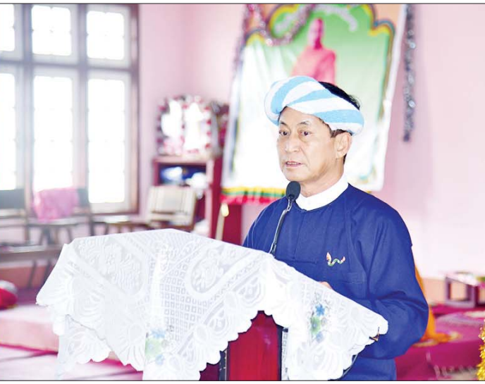
နိုင်ငံတော်စီမံအုပ်ချုပ်ရေးကောင်စီအဖွဲ့ဝင် ခွန်စုံလွင် ဟိုပုံးမြို့နယ် စံဖူးကျေးရွာ ဘုန်းတော်ကြီးကျောင်း၌ ရေဘေးသင့်ပြည်သူများကို တွေ့ဆုံအားပေးစကားပြောကြားစဉ်။

လှူဖွယ်ဝတ္ထုပစ္စည်းများ ဆက်ကပ် ဦးစွာ ဟိုပုံးမြို့ နောင်တောင်း ပရဟိတ တပ်ဦးကျောင်းတိုက် ပဓာန နာယက ဆရာတော် ဘဒ္ဒန္တရာဇိန္ဒထံမှ ငါးပါးသီလခံယူ ဆောက်တည်ကြပြီး ပရိတ် တရားတော်များ နာယူကြကာ ဆရာတော်၊ သံဃာတော်များအား နိုင်ငံတော်စီမံအုပ်ချုပ်ရေးကောင်စီ