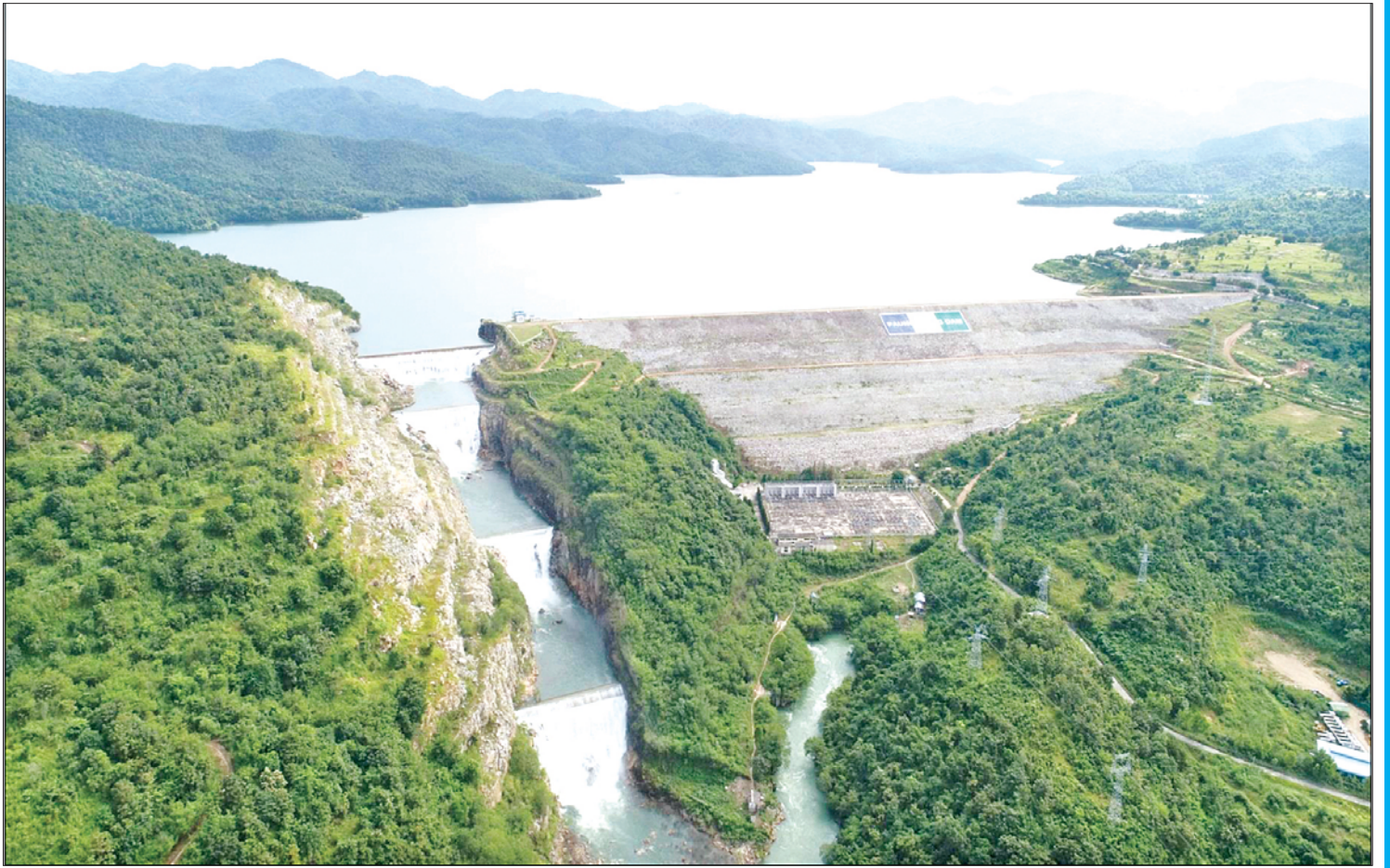
ပေါင်းလောင်းရေလှောင်တံ၏ ရေပိုလွှဲမှ ရေကျော်စီးဆင်းမှုကို တွေ့ရစဉ်။

ရေလှောင်တံတည်ဆောက်ရာတွင် ရေဆင်းစရိတ်တစ်ခုလုံးမှ စီးဝင်ရေအားလုံးကို တစ်အတွင်း ထိန်းချုပ်သို့လှောင်မည်ဆိုပါက ကြီးမားသော တစ်ခွင်အစားအတွက် ကုန်ကျစရိတ်များပြားခြင်း၊ အောက်ဘက်မြစ်ချောင်းများအတွင်းသို့ ရေစီးဆင်းမှုရပ်တန့်သွားမည်ဖြစ်သဖြင့် မြစ်၏ ဂေဟစနစ်ပျက်စီးလာခြင်းများ ဖြစ်ပေါ်လာနိုင်သောကြောင့် ရေပေးဝေမည့် စိုက်ပျိုးစရိယာ (သို့မဟုတ်) ရေအားလျှပ်စစ်ထုတ်လုပ်မှုအတွက် လိုအပ်သော ရေပမာဏအချို့