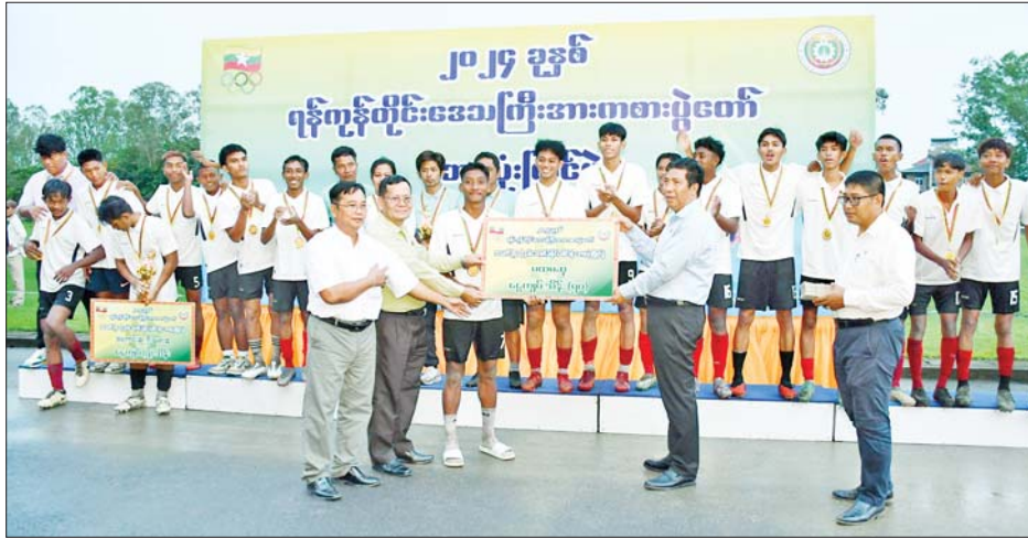
ဒဂုံမြို့သစ်ခရိုင်ဘောလုံးအသင်းတို့၏ ယှဉ်ပြိုင်နေမှု များကို ကြည့်ရှုအားပေးသည်။ ဗိုလ်လှပွဲတွင် ဗိုလ်တထောင်ခရိုင်အသင်းက

ဦးစွာ ရန်ကုန်တိုင်းဒေသကြီး အားကစားနှင့် ကာယပညာကော်မတီဥက္ကဋ္ဌ တိုင်းဒေသကြီး လူမှုရေးရာဝန်ကြီးနှင့် တာဝန်ရှိသူများက ဗိုလ်လှပွဲ ဖြစ်သည့် ဗိုလ်တထောင်ခရိုင်ဘောလုံးအသင်းနှင့်