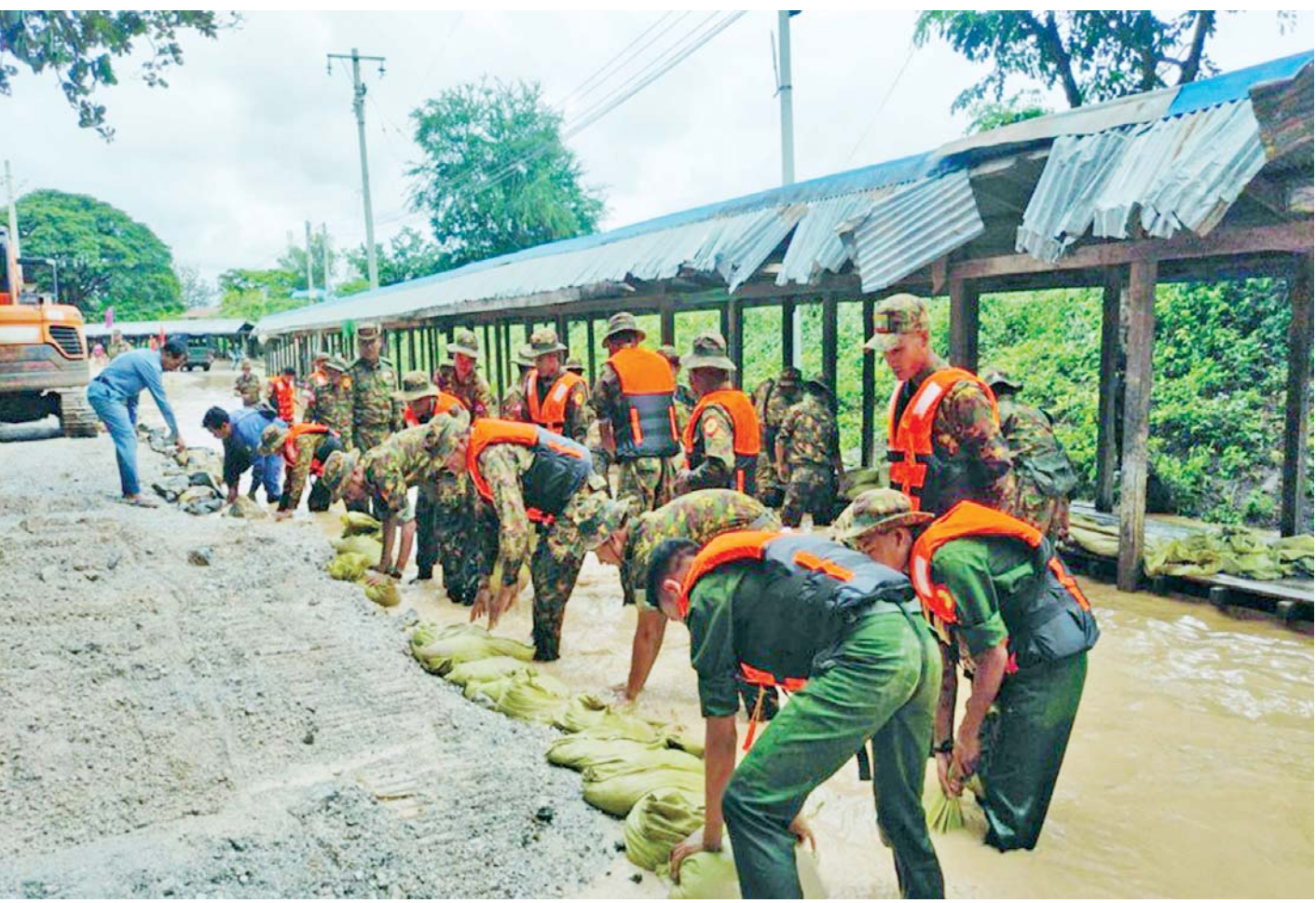
ရေကြီးရေလျှံမှုဖြစ်ပေါ်ခဲ့သည့်နေရာ၌ တပ်မတော်သားများနှင့်တာဝန်ရှိသူများက ပြန်လည်ထူထောင်ရေးလုပ်ငန်းများ ဆောင်ရွက်စဉ်။

နေပြည်တော် စက်တင်ဘာ ၂၃ နေပြည်တော်ကောင်စီနယ်မြေ အပါအဝင် တိုင်းဒေသကြီးနှင့် ပြည်နယ်များရှိ ရေကြီးရေလျှံမှု ဖြစ်ပေါ်ခဲ့သည့် ရပ်ကွက်/ကျေးရွာများတွင် ကူညီကယ်ဆယ်ရေးလုပ်ငန်းများနှင့် ပြန်လည်ထူထောင်ရေးလုပ်ငန်းများကို အင်တိုက်အားတိုက် တက်ကြွစွာ ပူးပေါင်းဆောင်ရွက်ပေးလျက်ရှိသည်။ တက်ကြွစွာဆောင်ရွက်ပေးလျက်ရှိ ယနေ့တွင်လည်း နေပြည်တော်ကောင်စီနယ်မြေ ဇေယျာသီရိမြို့နယ်၊ ပျဉ်းမနားမြို့နယ်၊ တပ်ကုန်းမြို့နယ်၊ လယ်ဝေးမြို့နယ်၊ ပုဗ္ဗသီရိမြို့နယ်တို့တွင် လည်းကောင်း၊ ရှမ်းပြည်နယ်(တောင်ပိုင်း) ကလေးမြို့နယ်တွင်လည်းကောင်း၊ ကယားပြည်နယ်လွိုင်ကော်မြို့နယ်နှင့် လွိုင်လင် လေးမြို့နယ်တို့တွင်လည်းကောင်း ဘုန်းတော်ကြီးကျောင်းများ၊ စာသင်ကျောင်းများ၊ ဆေးရုံ၊ ဆေးခန်းများ၊ ဌာနဆိုင်ရာအဆောက်အအုံများတွင် လိုအပ်သည်များ ကူညီရွှေ့ပြောင်းပေးခြင်းနှင့် သန့်ရှင်းရေးလုပ်ငန်းများ ဆောင်ရွက်ပေးခြင်း၊ လမ်း၊ တံတားများ၊ ရပ်ကွက်၊ ကျေးရွာများ အတွင်း၌ တင်ကျန်ခဲ့သည့်နွမ်းနယ်မှု၊ သစ်ပင်သစ်ကိုင်းများ ဖယ်ရှားပေးခြင်းအပါအဝင် အခြားလိုအပ်သည်များကို တပ်မတော်သားများ၊ မြန်မာနိုင်ငံရဲတပ်ဖွဲ့ဝင်များ၊ မီးသတ်တပ်ဖွဲ့ဝင်များ၊ ကြက်ခြေနီတပ်ဖွဲ့ဝင်များနှင့် လူမှုဝန်ထမ်းကယ်ဆယ်ရေးအဖွဲ့များက ဒေသခံပြည်သူများနှင့်ပူးပေါင်း၍ တက်ကြွစွာဆောင်ရွက်ပေးလျက်ရှိသည်။ စာမျက်နှာ ၅ ကော်လံ ၁ သို့ ။