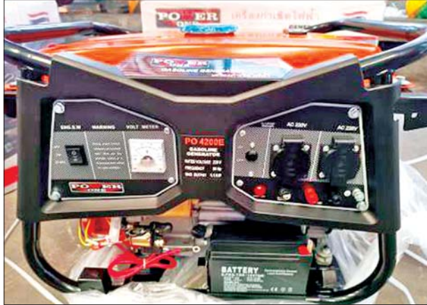
မြန်မာ့စက်မှုဆိပ်ကမ်း၌ ဖမ်းဆီးရမိမှု။

ခဲ့ရာ ဆိုင်ကယ်ခိုးယူရာတွင် အသုံးပြုသည့် မာစတာကီး တစ်ချောင်းကို တွေ့ရှိခဲ့ပြီး ဆက်လက်စစ်ဆေး ဆောင်ရွက်ခဲ့ရာ ခိုးယူထားသည့် မော်တော်