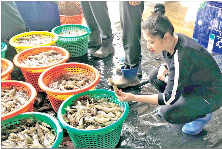
မြန်မာ့ပန်းပိုးပုစွန်ဖြူကို ပြည်ပဝယ်လက်များ လေ့လာကြည့်ရှုနေကြစဉ်။

ယခုနှစ်မိုးရာသီတွင် မိုးရွာသွန်းမှုများ၍ ရေငန်ပါဝင်နှုန်း ကျဆင်းခြင်း၊ ထိုင်းနိုင်ငံမှ ဝယ်ယူစိုက်ထည့်သောမျိုးစိတ်များ ကြီးထွားနှုန်းကျဆင်းခြင်းတို့