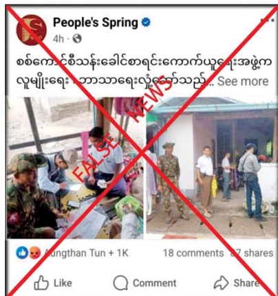
လူမှုရေး၊ စီးပွားရေး၊ ပညာရေး၊ ကျန်းမာရေး၊ လုံခြုံရေး စသည့်လိုအပ်သည့် လုပ်ငန်းများကို ဖြည့်ဆည်း ဆောင်ရွက်ပေးနိုင်မည်ဖြစ်ရာ သန်းခေါင်စာရင်းသည် နိုင်ငံတော်၏ စီမံကိန်း များအောင်မြင်စေရန် အထောက်အပံ့ဖြစ်စေ

နေပြည်တော် အောက်တိုဘာ ၃ နိုင်ငံတော် စီမံအုပ်ချုပ်ရေးကောင်စီ၏ ဝန်ထမ်းများက သန်းခေါင်စာရင်းကောက် ခံစဉ် လူမျိုးရေး၊ ဘာသာရေးလှုံ့ဆော်သည့် စကားများပြောကြောင်း တရားမဝင် ပြည်ပျက် မိဒီယာများက သတင်းအမှားများ မဟုတ်မမှန် ရေးသားဖြန့်ဝေလျက်ရှိကြောင်း တွေ့ရှိရ သည်။ ရေးသားဖြန့်ဝေနေ ပြည်ပျက်မိဒီယာများသည် နိုင်ငံတော် အစိုးရတို့ ပြည်သူ့လူထုက အထင်အမြင်လွှဲမှား စေရန် ရည်ရွယ်ချက်ရှိရှိ ရေးသားဖြန့်ဝေနေ ခြင်းသာဖြစ်ကြောင်း၊ လူဦးရေစာရင်းနှင့် ဆက်စပ်သည့်အကြောင်းအရာအချက်အလက် များကို တိကျမှန်ကန်စွာ ကောက်ယူပြုစုရ ခြင်းဖြစ်ကြောင်း၊ ရရှိလာမည့် စာရင်းများကို အခြေခံ၍ နိုင်ငံတော်နှင့် ပြည်သူများအတွက်