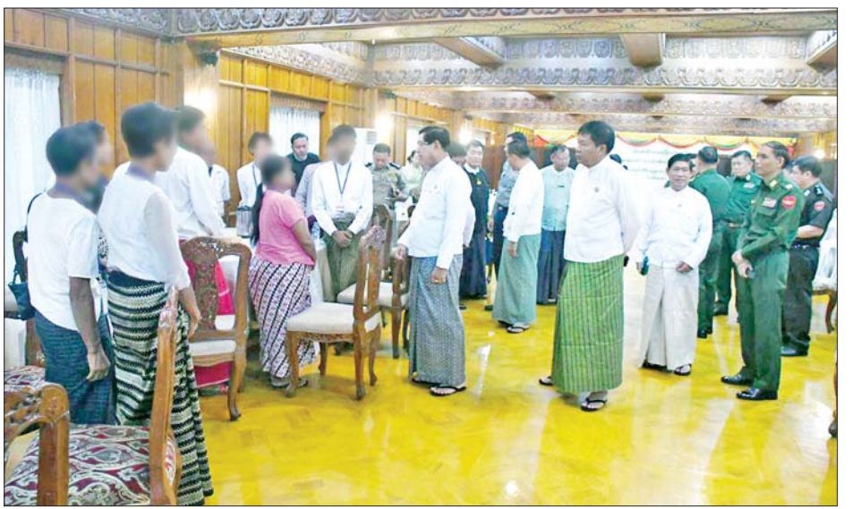
ပြီးဖြစ်ရာ ပြစ်မှုကျူးလွန်ခြင်းမရှိသော PDF အဖွဲ့ ဝင်များက တိုင်းဒေသကြီးနှင့် ပြည်နယ်အသီးသီး၌ ဥပဒေဘောင်အတွင်း ပြန်လည်ဝင်ရောက်လျက်ရှိကြ သဖြင့် သက်ဆိုင်ရာ တာဝန်ရှိသူများက ၎င်းတို့၏ မိဘအုပ်ထိန်းသူများထံသို့ လွှဲပြောင်းအပ်နှံပေးလျက် ရှိကြောင်း သိရသည်။ သတင်းစဉ်

အုပ်ထိန်းသူများထံသို့ လွှဲပြောင်းအပ်နှံကာ ထောက်ပံ့ပစ္စည်းများ ပေးအပ်သည်။ ယင်းနောက် ဥပဒေဘောင်အတွင်း ပြန်လည်ဝင်ရောက်ခဲ့သည့် ပြစ်မှုကျူးလွန်ခြင်းမရှိသော PDF သင်တန်းဆင်း လူငယ်များ၏ မိသားစုဝင်များကိုယ်စား အုပ်ထိန်းသူ တစ်ဦးက ကျေးဇူးတင်စကား ပြန်လည်ပြောကြား သည်။ ယင်းနောက် တိုင်းဒေသကြီး ဝန်ကြီးချုပ်၊ တိုင်းမှူးနှင့် တာဝန်ရှိသူများက ဥပဒေဘောင်အတွင်း ပြန်လည်ဝင်ရောက်လာသူများနှင့် မိသားစုဝင်များ အား ရင်းရင်းနှီးနှီး တွေ့ဆုံနှုတ်ဆက်ခဲ့ပြီး စားသောက် ဖွယ်ရာများဖြင့် ဧည့်ခံခဲ့ကြသည်။ PDF အပါအဝင် အဖွဲ့အစည်းအမျိုးမျိုးတို့ အနေဖြင့် နိုင်ငံတော်၏ ရှေ့လုပ်ငန်းစဉ်များတွင် ပါဝင်ပူးပေါင်းဆောင်ရွက်နိုင်ရေး သတ်မှတ် စည်းကမ်းချက်များနှင့်အညီ ဥပဒေဘောင်အတွင်းသို့ လက်နက်အပ်နှံပြီး ပြည်သူ့ဘဝသို့ ပြန်လည် ဝင်ရောက်ခြင်းပြုမည်ဆိုပါက ကြိုဆိုလက်ခံသွား မည်ဖြစ်ကြောင်း နိုင်ငံတော်အစိုးရက ထုတ်ပြန်ထား