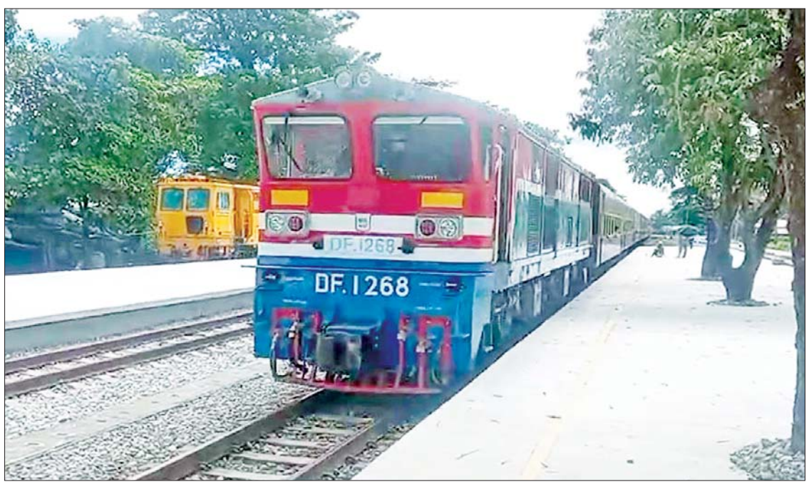
အမှတ်(၁၁) အဆန် လူစီးအမြန်ရထား ကျောက်တံခါးဘူတာသို့ ရောက်ရှိစဉ်။

ရေတိုက်စားမှုကြောင့် ပျက်စီးသွား သည့် ဝမ်းတွင်းမြို့နယ် သဲတောနှင့် သပြေတောင်းအကြား ရထားလမ်းပိုင်းနှင့် မိုင်တိုင်(၃၃၃/၁)ရှိ အဆန်လမ်းတံတား အမှတ်(၆၉၁)၏ ကမ်းကပ်ခုံရေတိုက်စား ခံရခြင်း၊ အစုန်လမ်းတံတား အမှတ်(၆၉၁) ၏ ပေ(၄၀)သံပေါင်လေးခု ရေထဲပြုတ်ကျ ခြင်း၊ အဆန်လမ်း/အစုန်လမ်းရထားလမ်း တာပေါင် ရေတိုက်စားခံရခြင်းများတွင် အဆန်လမ်းတံတား အမှတ်(၆၉၁)ကို ယာယီတံတား ဘေလီသံပေါင်နှင့် Steel Girder များ ထည့်သွင်းခြင်း၊ ရေတိုက်စား တာပေါင်များကို သံလမ်းဖြုတ်သိမ်း၍ သဲအိတ်စီထုပ်ခြင်း၊ (၆ x ၉) လက်မ ကျောက်ကြီးများထည့်သွင်းခြင်း၊ မြေဖို့ခြင်း များ ဆောင်ရွက်ပြီးနောက် သံလမ်း