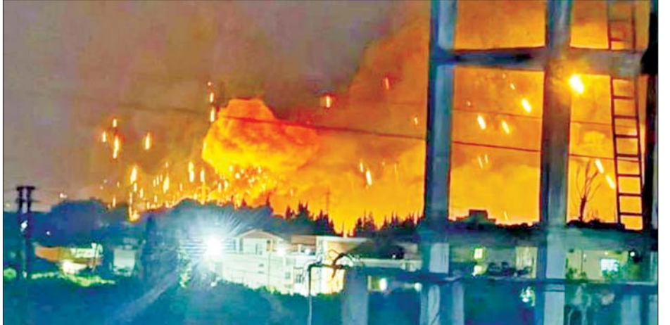
နတ်ဆာလာ၏သမက်ဖြစ်သူ ဟာဆန်ဂျက် လေကြောင်းတိုက်ခိုက်မှုအတွင်း သေဆုံးခဲ့သည်။ ဖာကွီဆာ အပါအဝင် လက်ဘနွန်နိုင်ငံသား နှစ်ဦး သည် ဒမတ်စကတ်မြို့ရှိ နေအိမ်တွင် အစ္စရေး၏ ကိုးကား- ဆင်ဟွာ ဘာသာပြန်-စိုးသူရ

သိရသည်။ အဆိုပါလက်နက် သိုလှောင်ရုံသည် ဆီးရီးယားနိုင်ငံ အနောက်မြောက်ပိုင်း Latakia ပြည်နယ်တွင် တည်ရှိသော အကြီးဆုံး ရှုရှားလေတပ် စခန်းဖြစ်သည့် Hmeimim လေတပ်စခန်းအနီးတွင် တည်ရှိသည်။ ယင်းတိုက်ခိုက်မှုအတွင်း အသေအပျောက် သတင်းများကို ချက်ချင်းထုတ်ပြန်ခြင်းမရှိသေးပေ။ အဆိုပါတိုက်ခိုက်မှုသည် ယခုသီတင်းပတ်အတွင်း ဆီးရီးယားတွင် အစ္စရေး၏ လေကြောင်းတိုက်ခိုက် ခဲ့ပြီးနောက် ဖြစ်ပွားခဲ့ခြင်း ဖြစ်သည်။ ဟစ်ဇဘိုလာခေါင်းဆောင် ဆာယီဟာဆန်