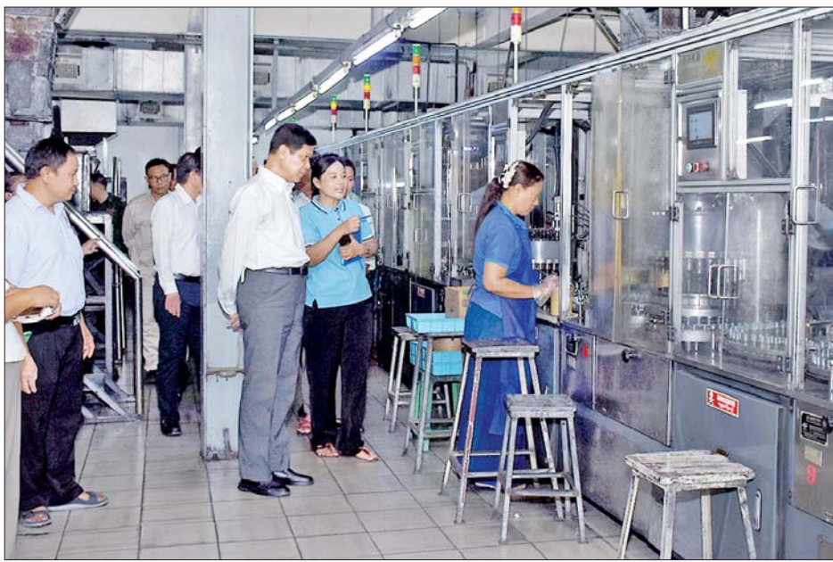
သည့်စက်ရုံသို့ လည်းကောင်း၊ ထန်းဇယ်ကုမ္ပဏီ လီမိတက်၏ မန္တလေးချည်မျှင်စက်ရုံ(၂)သို့ လည်းကောင်း ကွင်းဆင်းစစ်ဆေးခဲ့သည်။ အဆိုပါစက်ရုံများသို့ရောက်ရှိစဉ်တိုင်းဒေသကြီး

မန္တလေး အောက်တိုဘာ ၃ မန္တလေးတိုင်းဒေသကြီးဝန်ကြီးချုပ် ဦးမျိုးအောင် သည်တိုင်းဒေသကြီးဝန်ကြီးများ၊ တာဝန်ရှိသူများနှင့် အတူ ယနေ့မုန်လွဲပိုင်းက မဟာအောင်မြေခရိုင် ပြည်ကြီးတံခွန်မြို့နယ် စက်မှုဇုန်(၁)ရှိ ACRY LIC-YARN ဆီလွန်ချည်ထုတ်စက်ရုံ၊ ခုံးပုံဂျုံစက်ရုံ၊ မန္တလေးချည်မျှင်စက်ရုံ(၂)၊ ၉၉၉ နှင့် ပါဝါတံဆိပ် ဓာတ်ခဲစက်ရုံများသို့ ကွင်းဆင်းစစ်ဆေးပြီး ပြည်ကြီး တံခွန်မြို့နယ်တွင် ၂၀၂၄ ခုနှစ် လူဦးရေနှင့် အိမ် အကြောင်းအရာ သန်းခေါင်စာရင်းကောက်ယူနေမှု အား ကြည့်ရှုအားပေးခဲ့သည်။ ဦးစွာ တိုင်းဒေသကြီးဝန်ကြီးချုပ်နှင့် အဖွဲ့သည် အောင်စိန် တက်စတိုင်း ကုမ္ပဏီလီမိတက်၏ ACRY LIC-YARN ဆီလွန်ချည်မျှင်ထုတ်စက်ရုံသို့ ရောက်ရှိ ပြီး တရုတ်နိုင်ငံမှ ACRY LIC Fiber ကုန်ကြမ်းများကို ဝယ်ယူတင်သွင်းပြီး ကုန်ချော ACRY LIC-YARN ဆီလွန်ချည်မျှင်ထုတ်စက်မှုကို လည်းကောင်း၊ ယင်းနောက် Lluvia Ltd. ၏ ခုံးပုံဂျုံစက်ရုံသို့ လည်းကောင်း၊ ဆက်လက်၍ စွမ်းအားမြင့်ကုမ္ပဏီ လီမိတက်၏ ၉၉၉ နှင့် ပါဝါတံဆိပ် ဓာတ်ခဲထုတ်လုပ်