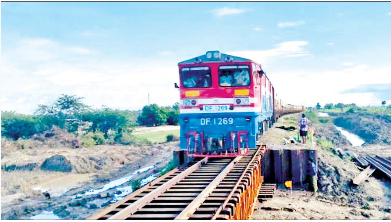
သဲတောနှင့်သပြေတောင်းကြား ရထားလမ်းပြုပြင်ပြီးနေရာ၌ အမှတ် (၁၂) အစုန် ရထားဖြတ်သန်းနေစဉ်။

နေပြည်တော် အောက်တိုဘာ ၃ တိုင်ဖွန်းမုန်တိုင်း “ရာဂီ”၏ အရှိန်ကြောင့် မိုးသည်းထန်စွာ ရွာသွန်းခဲ့ပြီး နေပြည်တော် ကောင်စီနယ်မြေ မန္တလေးတိုင်း ဒေသကြီးတို့နှင့် ဆက်စပ်သည့် ရန်ကုန် - မန္တလေးရထားလမ်း မကြီး၏အချို့ရထားလမ်းတာပေါင် နေရာများနှင့် တံတားများ ရေတိုက်စား၍ ပျက်စီးခဲ့မှုများ ကြောင့် ရန်ကုန်-မန္တလေး ရထား ခရီးစဉ်များကို စက်တင်ဘာ ၁၁ ရက်မှစတင်၍ ယာယီရပ်နားထား ခဲ့ရသည်။ မြန်မာ့မီးရထားအနေဖြင့် ရထား လမ်းနှင့်တံတားများ ပြင်ဆင်မွမ်းမံမှုကို လူအင်အား၊ ပစ္စည်း အင်အား၊ ထိရောက်သော ထောက်ပံ့ပို့ဆောင်ရေး အစီအစဉ်တို့ဖြင့် စာမျက်နှာ ၁၆ ကော်လံ ၁ သို့ ၀