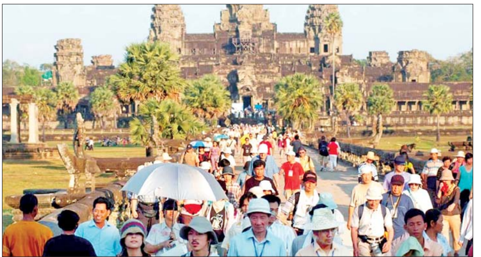
ယဉ်ကျေးမှုအဖွဲ့ (ယူနက်စကို) ၏ ကမ္ဘာ့အမွေအနှစ် နိုင်ငံ၌ အကျော်ကြားဆုံး ခရီးသွားနေရာတစ်ခုဖြစ် စာရင်းဝင်ခဲ့သည့် အန်ကော့ပန်နယ်မြေ သည် ကမ္ဘောဒီးယား သည်။ ကိုးကား-ဆင်ဟွာ၊ ဘာသာပြန်-အလင်းသစ်

နိုင်ငံပိုင် Angkor Enterprise ၏ ထုတ်ပြန်ချက်အရ သိရသည်။ အဆိုပါဒေသသို့ လာရောက်လည်ပတ်ခဲ့သည့် အဓိကနိုင်ငံများမှာ အမေရိကန်၊ ဗြိတိန်၊ ပြင်သစ်၊ တောင်ကိုရီးယားနှင့် တရုတ်တို့ဖြစ်ကြောင်း အစီရင်ခံစာတွင် ဖော်ပြထားသည်။ ယခုနှစ် စက်တင်ဘာလတစ်လတည်းမှာပင် အန်ကော့ပန်နယ်ဒေသသို့ အားလပ်ရက်အပန်းဖြေခရီး လာရောက်သူ ၄၇၉၉၃ ဦးရှိခဲ့ပြီး ယမန်နှစ် အလားတူ လနှင့်နှိုင်းယှဉ်ပါက ၁၆ ဒသမ ၉ ရာခိုင်နှုန်းနှင့် အမေရိကန် ဒေါ်လာ ၂ ဒသမ ၁၈ သန်းဝင်ငွေရရှိခဲ့ခြင်း ကြောင့် ဝင်ငွေအားဖြင့် ၁၇ ဒသမ ၄ ရာခိုင်နှုန်း မြင့်တက်လာခဲ့ကြောင်း ထုတ်ပြန်ချက်တွင် ဖော်ပြ ထားသည်။ ၁၉၉၂ ခုနှစ်တွင် ကုလသမဂ္ဂ ပညာရေး၊ သိပ္ပံနှင့်