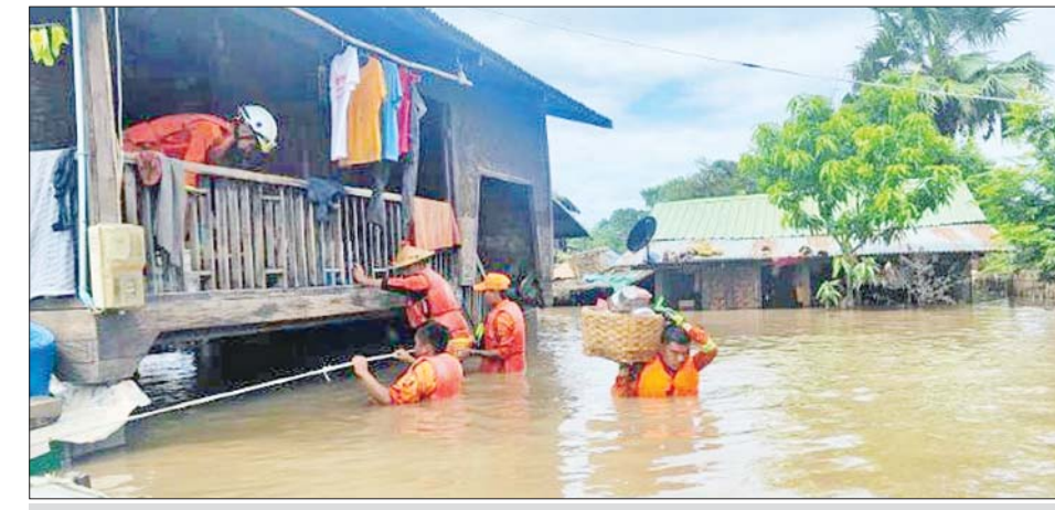
ကူညီကယ်ဆယ်ရေးအဖွဲ့များက ဒေသခံပြည်သူများအား ရေဘေးလွတ်ရာသို့ ကူညီရွှေ့ပြောင်းပေးစဉ်။

အဆိုပါမြစ်သားမြို့နယ်အတွင်း ရေကြီးရေလျှံမှု မဖြစ်ပေါ်မီ သက်ဆိုင်ရာတာဝန်ရှိသူများက အသိပေး တိုက်တွန်းနှိုးဆော်ခြင်းများ၊ ကူညီရွှေ့ပြောင်းပေး ခြင်းများကို အချိန်မီဆောင်ရွက်ပေးနိုင်ခဲ့သဖြင့် ရေဘေးကြောင့် ဒေသခံပြည်သူများ ထိခိုက်သေဆုံး ဒဏ်ရာရရှိမှုမရှိကြောင်း သိရသည်။