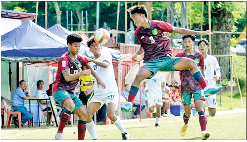
ရှမ်းယူနိုက်တက်အသင်းနှင့် မြဝတီအသင်းတို့ ယှဉ်ပြိုင်ကစားကြစဉ်။

ရန်ကုန် အောက်တိုဘာ ၃ ၂၀၂၄ ရာသီ MNL ယူ-၂၀ လိဂ်ပြိုင်ပွဲ ပွဲစဉ် (၁၇) ပထမနေ့ကို အောက်တိုဘာ ၃ ရက်က ကျင်းပရာ ထိပ်ဆုံးမှ ဦးဆောင်နေသည့် ရှမ်းယူနိုက်တက်အသင်း နိုင်ပွဲဆက်ခဲ့သည်။ ဗဟန်း မြက်ခင်းတုကွင်း၌ ကျင်းပသည့်ပွဲတွင် ရှမ်းယူနိုက်တက်အသင်းက မြဝတီအသင်းကို တစ်ဂိုး-ဂိုးမရှိဖြင့် အနိုင်ရခဲ့သည်။ ချန်ပီယံဆုအတွက် ဇယားထိပ်ပိုင်းတွင် အသင်းများအပြိုင် ဖြစ်နေသဖြင့် ထိပ်ဆုံးတွင် ဦးဆောင်နေသည့် ရှမ်းယူနိုက်တက် စာမျက်နှာ ၁၅ ကော်လံ ၁ သို့ ❖