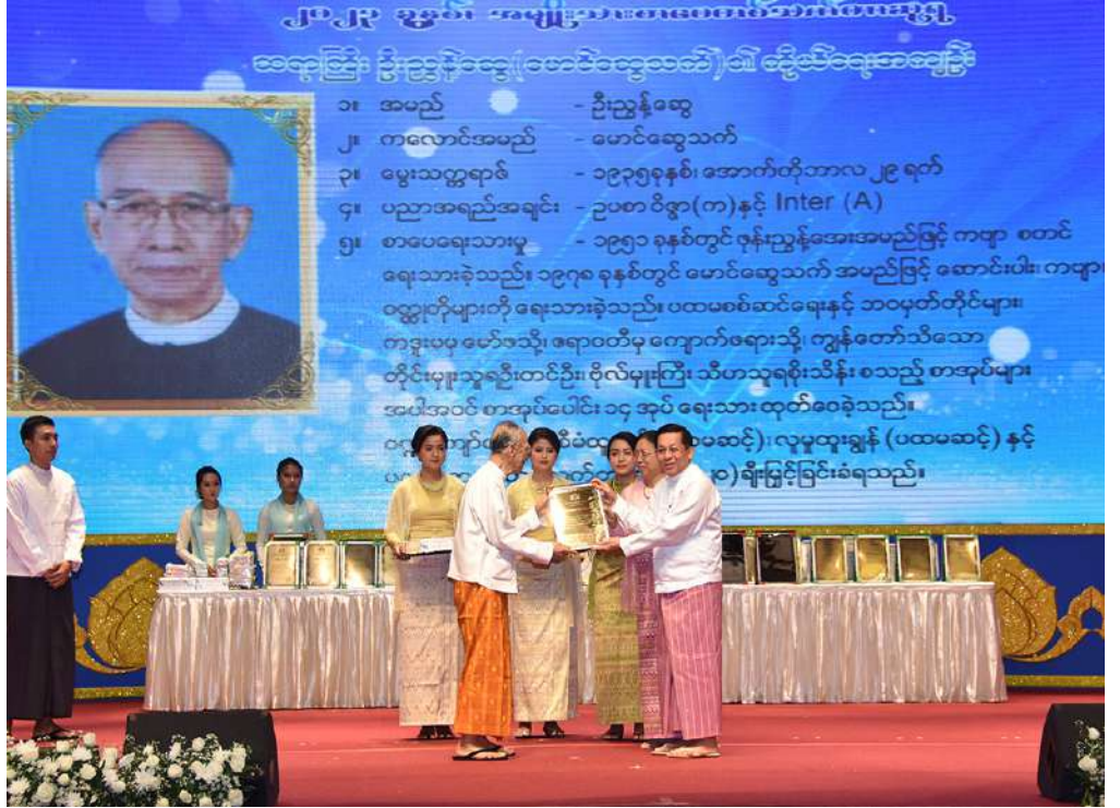
နိုင်ငံတော်စီမံအုပ်ချုပ်ရေးကောင်စီဥက္ကဋ္ဌ နိုင်ငံတော်ဝန်ကြီးချုပ် ဗိုလ်ချုပ်မှူးကြီးမင်းအောင်လှိုင်နှင့်ဇနီး ဒေါ်ကြူကြူလှ ၂၀၂၃ ခုနှစ် အမျိုးသားစာပေတစ်သက်တာဆုရ စာပေပညာရှင် ဆရာကြီး ဦးညွန့်ဆွေ (မောင်ဆွေသက်)အား ဆုတံဆိပ်ဂုဏ်ပြုချီးမြှင့်ငွေနှင့် အမှတ်တရဂုဏ်ပြုလက်ဆောင်ပေးအပ်ချီးမြှင့်စဉ်။