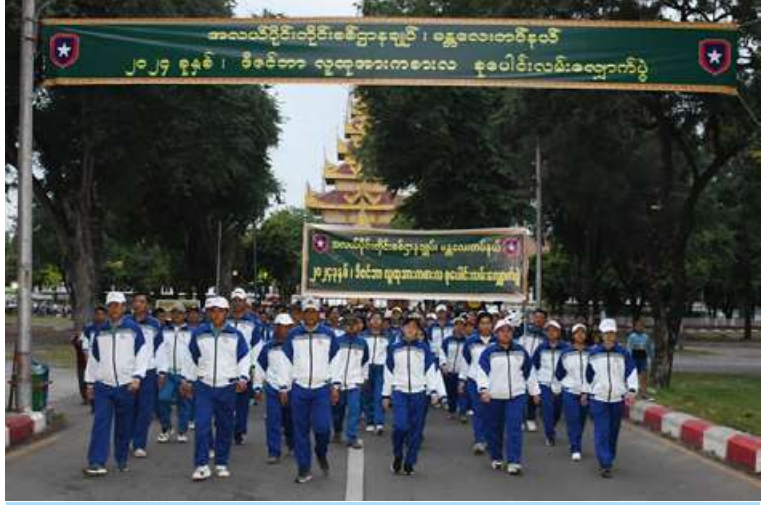
အလယ်ပိုင်းတိုင်းစစ်ဌာနချုပ် မန္တလေးတပ်နယ်၏ ၂၀၂၄ ခုနှစ် ဒီဇင်ဘာ အားကစား လ ပထမပတ် စုပေါင်းလမ်းလျှောက်ပွဲ ကျင်းပစဉ်။