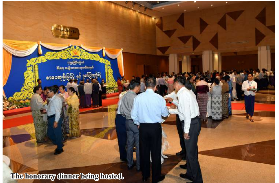
The honorary dinner being hosted.

After the dinner, the Senior General and wife presented a honorary flower basket for the artists. 100