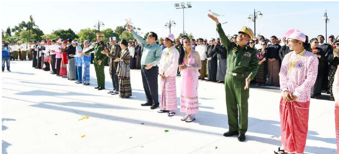
ကာကွယ်ရေးဦးစီးချုပ်ရုံး(ကြည်း)မှ ဒုတိယဗိုလ်ချုပ်ကြီးဖုန်းမြတ်၊ စစ်ရေးချုပ် ဒုတိယဗိုလ်ချုပ်ကြီးစိုးမင်းဦးနှင့် အခမ်းအနား တက်ရောက်လာကြသူများက သူရဲကောင်းစစ်သည်များ ထာဝရငြိမ်းချမ်းရေးရရှိစေရန်ရည်မှန်း၍ အထိမ်းအမှတ်ချီးဖြူငှက်များ ကို လွှတ်ပေးစဉ်။

ဒုတိယဗိုလ်ချုပ်ကြီး စိုးမင်းဦးနှင့် တပ်မတော်အရာရှိကြီးများ၊ မြန်မာနိုင်ငံ စစ်မှုထမ်းဟောင်းအဖွဲ့ဝင်များ၊ နိုင်ငံရေး ပါတီများမှ ပါတီခေါင်းဆောင်များ၊ ဘာသာပေါင်းစုံ ချစ်ကြည်ညီညွတ်ရေး အဖွဲ့ဝင်များ၊ ရောင်နီဦးနှင့်မိတ်ဆွေများ ပရဟိတအသင်း၊ ရွှေပြည်တော်သို့ ဆိုမှတ်ပရဟိတအသင်းနှင့် တပ်မတော် ကိုချစ်မြတ်နိုးသူများ တက်ရောက် ကြသည်။