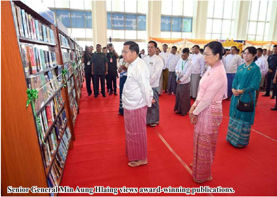
Senior General Min Aung Hlaing views award-winning publications.