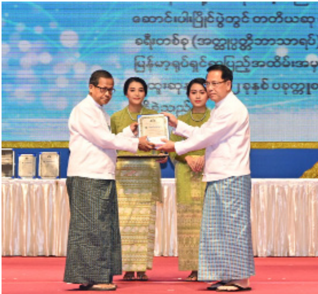
ပြည်ထောင်စုဝန်ကြီး ဦးမောင်မောင်အုန်း ၂၀၂၃ ခုနှစ် စာပေဗိမာန်စာမူဆု နိုင်ငံရေးစာပေ ပထမဆုရ ဆရာကိုတိုး(ရန်ကင်း)အား ဆုပေးအပ်ချီးမြှင့်စဉ်။