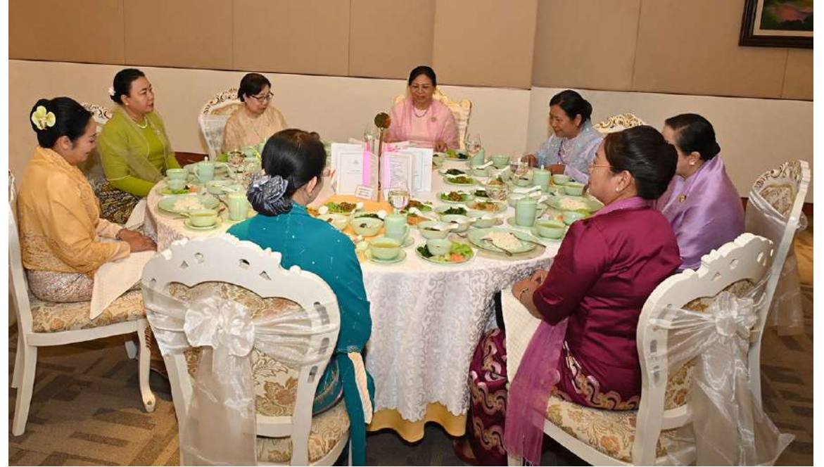
နိုင်ငံတော်စီမံအုပ်ချုပ်ရေးကောင်စီဥက္ကဋ္ဌ နိုင်ငံတော်ဝန်ကြီးချုပ် ဗိုလ်ချုပ်မှူးကြီးမင်းအောင်လှိုင်၏ ဇနီး ဒေါ်ကြာကြာလှ နှင့်အဖွဲ့ဝင်များက ၂၀၂၃ ခုနှစ်အတွက် အမျိုးသားစာပေတစ်သက်တာဆု၊ အမျိုးသားစာပေဆုနှင့် စာပေဗိမာန်စာမူဆုရရှိခဲ့ကြသူ များ၊ အနုပညာရှင်များ၊ စာပေပညာရှင်များနှင့်အတူ ဂုဏ်ပြုနေ့လယ်စာကို အတူတကွသုံးဆောင်စဉ်။

ယင်းနောက် နိုင်ငံတော်စီမံအုပ်ချုပ် ရေးကောင်စီဥက္ကဋ္ဌ နိုင်ငံတော်ဝန်ကြီးချုပ် နှင့်ဇနီးတို့က ၂၀၂၃ ခုနှစ် အမျိုးသားစာ ပေတစ်သက်တာဆုရရှိကြသည့် စာပေ ပညာရှင်ဆရာကြီး ဒေါက်တာမင်းတင်မွန်