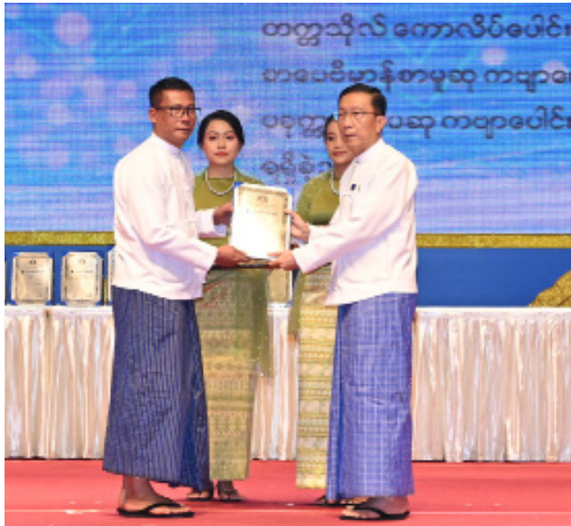
ဒုတိယဝန်ကြီးချုပ်နှင့် ပြည်ထောင်စုဝန်ကြီး ဦးဝင်းရှိန် ၂၀၂၃ ခုနှစ် စာပေဗိမာန်စာမူဆု ကလေးစာပေပထမဆုရ ဆရာကနောင်နိုင်နွယ်ဦးအား ဆုပေးအပ်ချီးမြှင့်စဉ်။