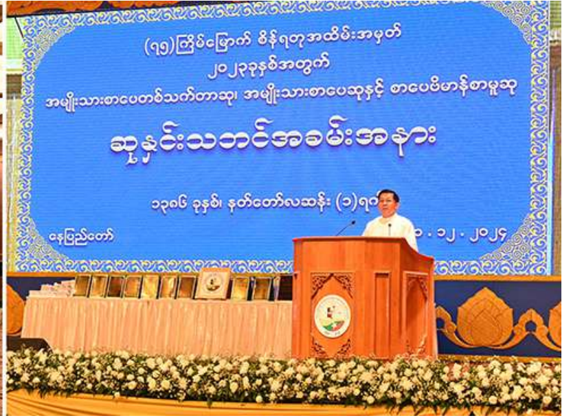
နိုင်ငံတော်စီမံအုပ်ချုပ်ရေးကောင်စီဥက္ကဋ္ဌ နိုင်ငံတော်ဝန်ကြီးချုပ် ဗိုလ်ချုပ်မှူးကြီးမင်းအောင်လှိုင် (၇၅)ကြိမ်မြောက် စိန်ရတနာအမျိုးသားစာပေဆုအထိမ်းအမှတ် ၂၀၂၃ ခုနှစ်အတွက် အမျိုးသားစာပေတစ်သက်တာဆု၊ အမျိုးသားစာပေဆုနှင့် စာပေဗိမာန်စာမူဆု ဆုနှင်းသဘင်အခမ်းအနားတွင် အမှာစကားပြောကြားစဉ်။