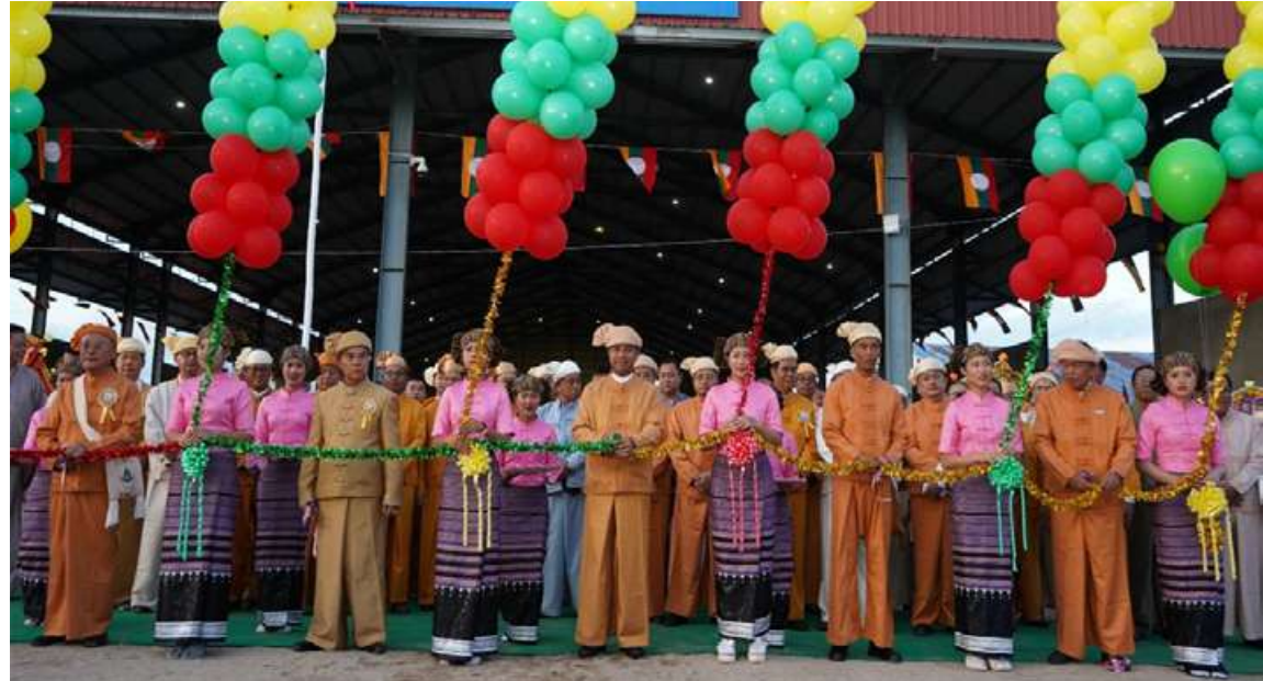
ရှမ်းပြည်နယ်ဝန်ကြီးချုပ် ဦးအောင်အောင်၊ ကြံ့ခိုင်ခံ့ခိုင်တိုင်းစစ်ဌာနချုပ် တိုင်းမှူး ဗိုလ်မှူးချုပ်စိုးလှိုင်နှင့် တာဝန်ရှိသူများက ရှမ်းတိုင်းရင်းသားများ၏ ရှမ်းနှစ် ၂၁၁၉ ခုနှစ် နှစ်သစ်ကူးပွဲတော်အထိမ်းအမှတ် မိတ်ဆုံစားပွဲအခမ်းအနားကို ဖဲကြိုးဖြတ်ဖွင့်လှစ်ပေးစဉ်။

နေပြည်တော် ဒီဇင်ဘာ ၁ ၂၀၂၄ ခုနှစ် ရှမ်းတိုင်းရင်းသားများ၏ ရှမ်းနှစ် ၂၁၁၉ ခုနှစ် နှစ်သစ်ကူးပွဲတော် အထိမ်းအမှတ်မိတ်ဆုံစားပွဲကို နိုဝင်ဘာ ၃၀ ရက် ညနေပိုင်းတွင် ရှမ်းပြည်နယ်(အရှေ့ပိုင်း) ကျိုင်းတုံမြို့ရှိ ခရိုင်အားကစားကွင်း၌ ပြုလုပ်ရာ ရှမ်းပြည်နယ်ဝန်ကြီးချုပ် ဦးအောင်အောင်၊ ကြံ့ခိုင်ခံ့ခိုင်တိုင်းစစ်ဌာနချုပ် တိုင်းမှူး ဗိုလ်မှူးချုပ်စိုးလှိုင်နှင့် အဖွဲ့ဝင်များ၊ ရှမ်းပြည်နယ်ဝန်ကြီးများ၊ ရှမ်းနှစ်သစ်ကူးပွဲတော် ဖြစ်မြောက်ရေးကော်မတီအဖွဲ့ဝင်များ၊ ပြည်နယ်အဆင့် ဌာနဆိုင်ရာတာဝန်ရှိသူများ၊ တိုင်းရင်းသားစာပေနှင့် ယဉ်ကျေးမှုအဖွဲ့များ၊ မြို့မိမြို့ဖများ၊ ဒေသခံတိုင်းရင်းသားများနှင့် ဖိတ်ကြားထားသည့် ဧည့်သည်တော်များ တက်ရောက်သည်။ ဦးစွာ ပြည်နယ်ဝန်ကြီးချုပ်၊ တိုင်းမှူးနှင့် တာဝန်ရှိသူများက ရှမ်းတိုင်းရင်းသားများ၏ ရှမ်းနှစ် ၂၁၁၉ ခုနှစ် နှစ်သစ်ကူးပွဲတော်အထိမ်းအမှတ် မိတ်ဆုံစားပွဲအခမ်းအနားကို ဖဲကြိုးဖြတ်ဖွင့်လှစ်ပေးပြီး