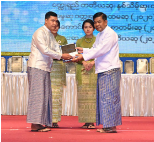
နိုင်ငံတော်စီမံအုပ်ချုပ်ရေးကောင်စီအဖွဲ့ဝင် ဗိုလ်ချုပ်ကြီးမောင်မောင်အေး ၂၀၂၃ ခုနှစ် စာပေဗိမာန်စာမူဆု ဝတ္ထုရှည်ပထမဆုရ ဆရာညိုမင်းညိုအား ဆုပေးအပ်ချီးမြှင့်စဉ်။