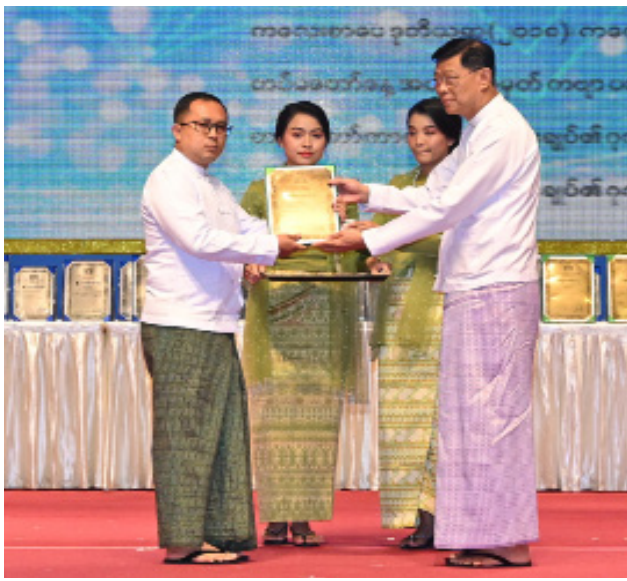
နိုင်ငံတော်စီမံအုပ်ချုပ်ရေးကောင်စီအဖွဲ့ဝင် ဗိုလ်ချုပ်ကြီးမြထွန်းဦး ၂၀၂၃ ခုနှစ် အမျိုးသားစာပေဆု ကလေးစာပေဆုဆရာပုလောစိုးနံ့သာအား ဆုပေးအပ်ချီးမြှင့်စဉ်။