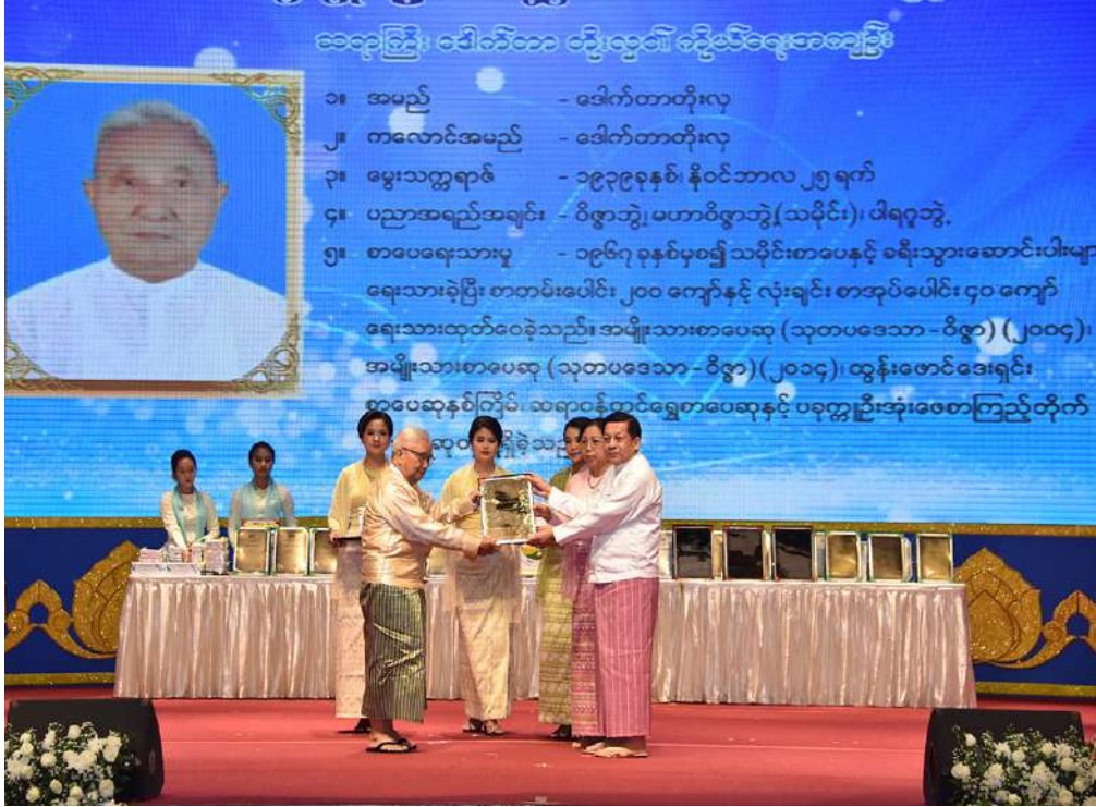
နိုင်ငံတော်စီမံအုပ်ချုပ်ရေးကောင်စီဥက္ကဋ္ဌ နိုင်ငံတော်ဝန်ကြီးချုပ် ဗိုလ်ချုပ်မှူးကြီးမင်းအောင်လှိုင်နှင့်ဇနီး ဒေါ်ကြူကြူလှ ၂၀၂၃ ခုနှစ် အမျိုးသားစာပေတစ်သက်တာဆုရ စာပေပညာရှင် ဆရာကြီး ဒေါက်တာတိုးလှအား ဆုတံဆိပ်ဂုဏ်ပြုချီးမြှင့်ငွေနှင့် အမှတ်တရဂုဏ်ပြုလက်ဆောင်ပေးအပ်ချီးမြှင့်စဉ်။