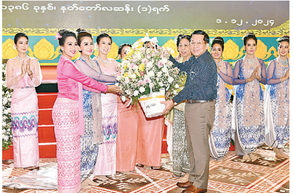
နိုင်ငံတော်စီမံအုပ်ချုပ်ရေးကောင်စီဥက္ကဋ္ဌ နိုင်ငံတော်ဝန်ကြီးချုပ် ဗိုလ်ချုပ်မှူးကြီးမင်းအောင်လှိုင်နှင့် ဇနီး ဒေါ်ကြူကြူလှတို့ သီဆိုတီးမှုတ်ဖျော်ဖြေခဲ့ကြသည့် အနုပညာရှင်များကို ဂုဏ်ပြုပန်းခြင်းပေးအပ် ချီးမြှင့်စဉ်။