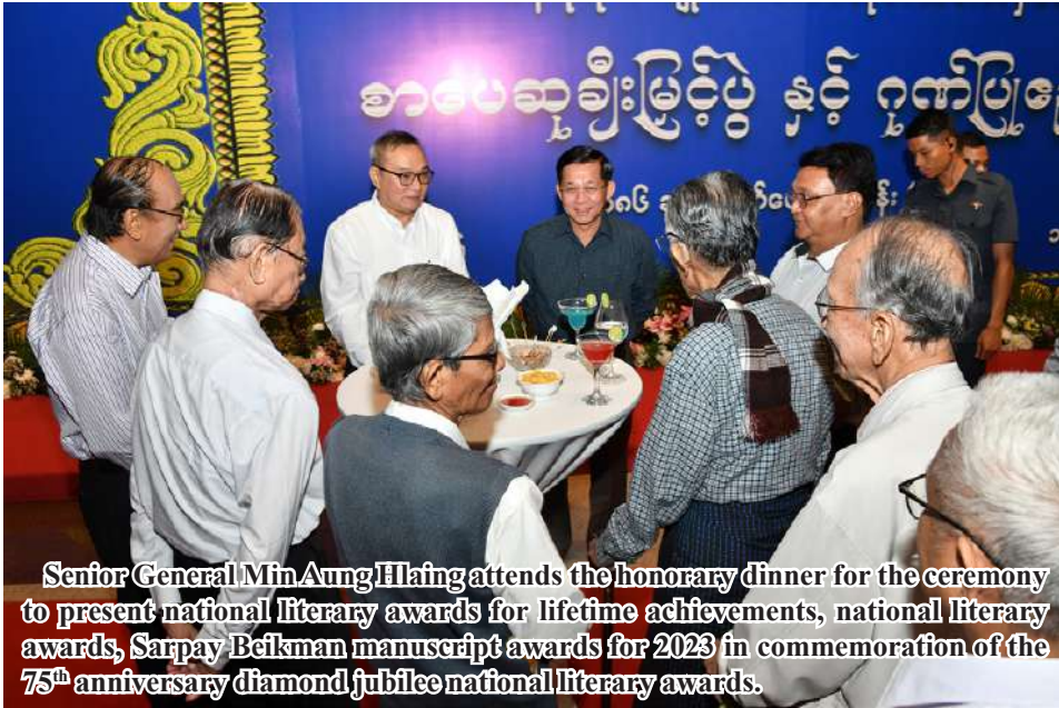
Senior General Min Aung Hlaing attends the honorary dinner for the ceremony to present national literary awards for lifetime achievements, national literary awards, Sarpay Beikman manuscript awards for 2023 in commemoration of the 75 th anniversary diamond jubilee national literary awards.

Nay Pyi Taw December 1 An honorary dinner was hosted this evening for the ceremony to present national literary awards for lifetime achievements, national literary awards, Sarpay Beikman manuscript awards for 2023 in commemoration of the 75 th anniversary diamond jubilee