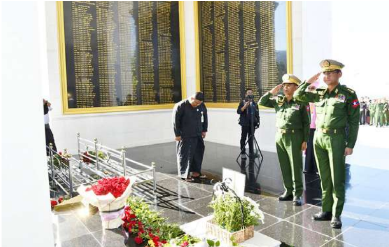
ကာကွယ်ရေးဦးစီးချုပ်ရုံး(ကြည်း)မှ ဒုတိယဗိုလ်ချုပ်ကြီးဖုန်းမြတ်နှင့်စစ်ရေးချုပ် ဒုတိယဗိုလ်ချုပ်ကြီးစိုးမင်းဦးတို့က တိုင်းပြည်အတွက် အသက်ပေးလှူသွားသော သူရဲကောင်းစစ်သည်များအတွက် ဂုဏ်ပြုပန်းခြင်းဖြင့် ဂါရဝပြုစဉ်။

နေပြည်တော် ဒီဇင်ဘာ ၁ နိုင်ငံတော်လုံခြုံရေး၊ တရားဥပဒေ စိုးမိုးရေးနှင့် အချုပ်အခြာအာဏာတည်တံ့ ခိုင်မြဲရေးတို့အတွက် တိုင်းပြည်တာဝန် ထမ်းဆောင်ရင်း အသက်ပေးလှူသွားခဲ့ သည့် ခေတ်အဆက်ဆက်မှ သူရဲကောင်း စစ်သည်များကို အောက်မေ့ဖွယ်ဂါရဝပြု ဆုတောင်းပွဲနှင့် အလေးပြုခြင်း အခမ်းအနားကို (၁၁)ကြိမ်မြောက်အဖြစ် ယနေ့နံနက်ပိုင်းတွင် နေပြည်တော် ကောင်စီနယ်မြေ ဇေယျာသီရိမြို့နယ်ရှိ သူရဲကောင်းဗိမာန်(နေပြည်တော်)၌ ကျင်းပ ပြုလုပ်သည်။