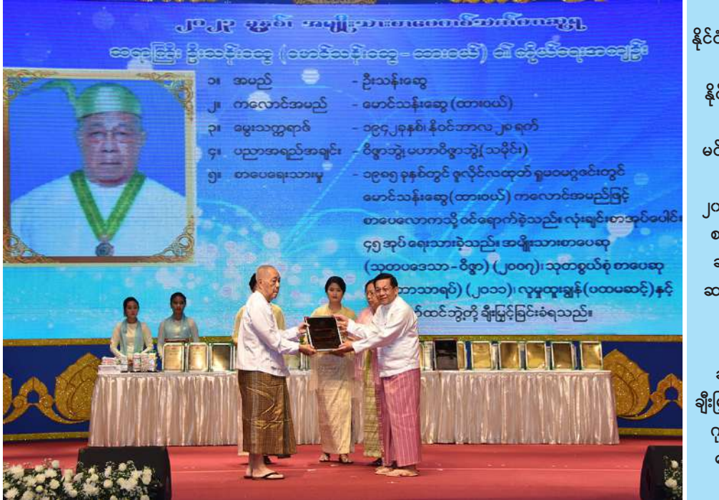
အစဉ်အလာကောင်းကို ၁၉၄၈ ခုနှစ်က စတင်ကျင်းပခဲ့သည်မှာ ယခုဆိုပါက (၇၅)ကြိမ်မြောက်ရှိပြီဖြစ်သဖြင့် စိန်ရတနာသက်တမ်းသို့ ရောက်ခဲ့ပြီဖြစ်ကြောင်း။ နိုင်ငံတော်၏ လွတ်လပ်ရေးမိသကားကြီး ဗိုလ်ချုပ်အောင်ဆန်း၏ လမ်းညွှန်မှုဖြင့် ၁၉၄၇ ခုနှစ် ဩဂုတ်လတွင်တည်ထောင်ခဲ့သည့် စာပေဗိမာန်သည် တိုင်းရင်းသား ပြည်သူများ နိုင်ငံတကာဗဟုသုတတိုးပွားရေးအတွက် ဘာသာပြန်စာပေများထုတ်ဝေခဲ့သကဲ့သို့ မြန်မာစာပေဖွံ့ဖြိုးရေးအတွက် ၁၉၄၈ ခုနှစ်တွင် “စာပေဗိမာန်ကာလပေါ်ဝတ္ထုဆု”ကို စတင်ချီးမြှင့်ခဲ့ကြောင်း။ “စာပေဗိမာန်ကာလပေါ်ဝတ္ထုဆု”ကို “စာပေဗိမာန်ဆု”၊ “အနုပညာစာပေဆိုင်ရာဆု”၊ “အမျိုးသားစာပေဆု” စသည်ဖြင့် ဆုအမည်ကို အဆင့်ဆင့်ပြောင်းလဲခဲ့ပြီး ဆုချီးမြှင့်မည့်ဘာသာရပ်များ၊ ဆုငွေများကို