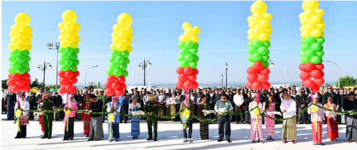
ကာကွယ်ရေးဦးစီးချုပ်ရုံး(ကြည်း)မှ ဒုတိယဗိုလ်ချုပ်ကြီးဖုန်းမြတ်၊ စစ်ရေးချုပ် ဒုတိယဗိုလ်ချုပ်ကြီးစိုးမင်းဦးနှင့် အခမ်းအနား တက်ရောက်လာကြသူများက တိုင်းပြည်အတွက် ခေတ်အဆက်ဆက်မှ အသက်ပေးလှူသွားသော သူရဲကောင်းစစ်သည်များ အတွက် (၁၁)ကြိမ်မြောက် အောက်မေ့ဖွယ်ဂါရဝပြုဆုတောင်းပွဲနှင့်အလေးပြုခြင်းအခမ်းအနားကို ဖဲကြီးဖြတ်ဖွင့်လှစ်ပေးစဉ်။