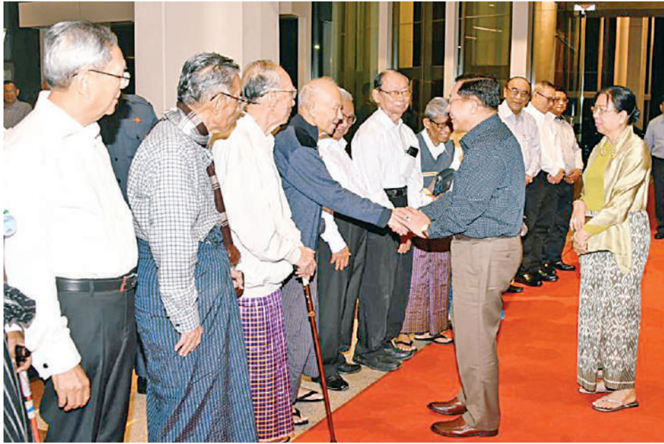
နိုင်ငံတော်စီမံအုပ်ချုပ်ရေးကောင်စီဥက္ကဋ္ဌ နိုင်ငံတော်ဝန်ကြီးချုပ် ဗိုလ်ချုပ်မှူးကြီးမင်းအောင်လှိုင်နှင့် ဇနီး ဒေါ်ကြူကြူလှတို့အား (၇၅)ကြိမ်မြောက် စိန်ရတု အမျိုးသားစာပေဆုအထိမ်းအမှတ် ၂၀၂၃ ခုနှစ် အတွက် အမျိုးသားစာပေတစ်သက်တာဆု၊ အမျိုးသားစာပေဆုနှင့် စာပေဗိမာန်စာမူဆု ဆုနှင်းသဘင်ဂုဏ်ပြု ညစာစားပွဲအခမ်းအနားသို့ တက်ရောက်လာကြသူများက ကြိုဆိုနှုတ်ဆက်ကြစဉ်။