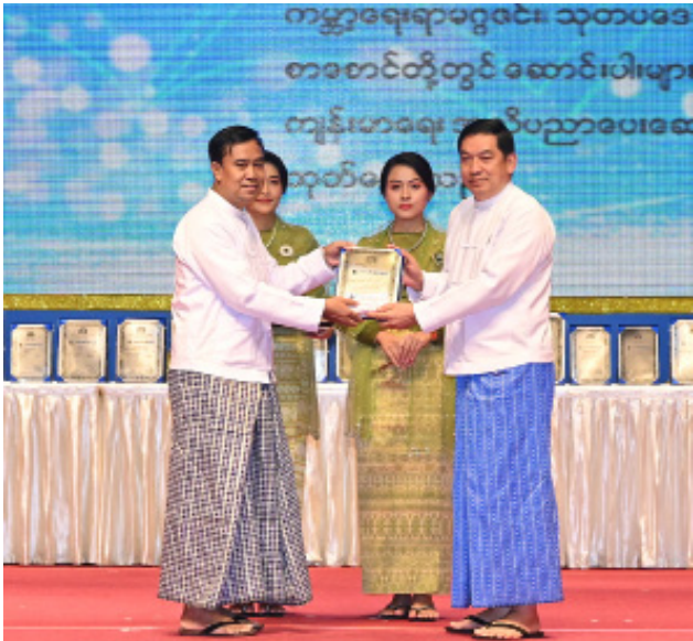
နိုင်ငံတော်စီမံအုပ်ချုပ်ရေးကောင်စီအဖွဲ့ဝင် ဗိုလ်ချုပ်ကြီးညိုစော ၂၀၂၃ ခုနှစ် စာပေဗိမာန်စာမူဆု သုတပဒေသာ (ရိုးရိုးသိပ္ပံနှင့် အသုံးချသိပ္ပံ) ဒုတိယဆုရ ဆရာ ဒေါက်တာကောင်းစံအား ဆုပေးအပ်ချီးမြှင့်စဉ်။