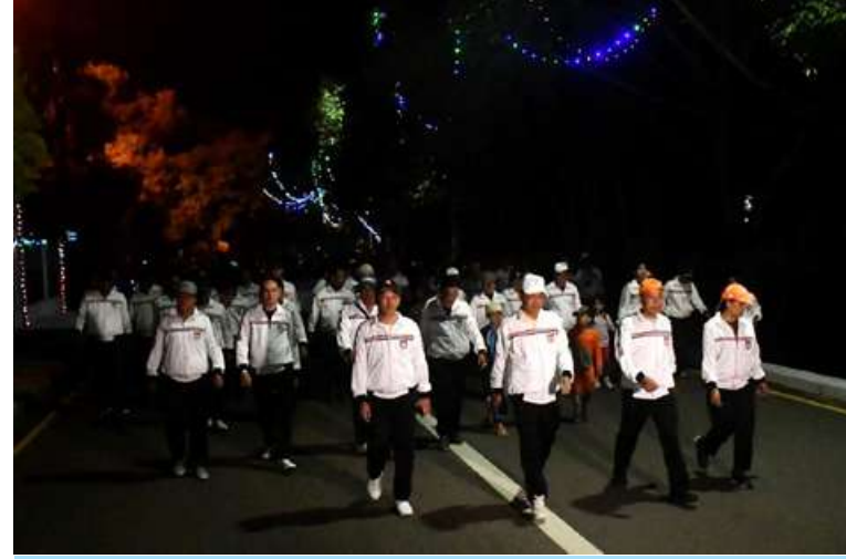
ရန်ကုန်တိုင်းစစ်ဌာနချုပ်နှင့် ကွပ်ကဲမှုအောက် တပ်နယ်များအလိုက် ၂၀၂၄ ခုနှစ် ဒီဇင်ဘာအားကစားလ ပထမပတ် စုပေါင်းလမ်းလျှောက်ပွဲ ကျင်းပစဉ်။

လည်းကောင်း၊ အနောက်မြောက်တိုင်း စစ်ဌာနချုပ် မုံရွာတပ်နယ်၏ စုပေါင်း လမ်းလျှောက်ပွဲကို တိုင်းစစ်ဌာနချုပ် စုပေါင်းတန်းစီကွင်း၌ လည်းကောင်း၊ အလယ်ပိုင်းတိုင်းစစ်ဌာနချုပ် မန္တလေး တပ်နယ်၏ စုပေါင်းလမ်းလျှောက်ပွဲကို နန်းမြို့တွင်းရှိ မြန်မာစစ်ကျော်ရွှေနန်းတော် ကြီးအနီး၌လည်းကောင်း၊ တောင်ပိုင်းတိုင်း စစ်ဌာနချုပ်နှင့် ကွပ်ကဲမှုအောက် တပ်နယ် များအလိုက် စုပေါင်းလမ်းလျှောက်ပွဲများ ကို တိုင်းစစ်ဌာနချုပ် အေးချမ်းဖြိုးခန်းမ ရှေ့နှင့် တပ်နယ်စစ်ရေးပြကွင်းများ၌ လည်းကောင်း အသီးသီးကျင်းပကြရာ တိုင်းမှူးများ၊ ဒုတိယတိုင်းမှူးများ၊ တိုင်းစစ်ဌာနချုပ်မှ တပ်မတော်အရာရှိကြီး များ၊ တပ်ရင်း၊ တပ်ဖွဲ့မှူးများနှင့် အရာရှိ စစ်သည်၊ မိသားစုဝင်များ ပါဝင်ဆင်နွှဲကြ ပြီး သတ်မှတ်နေရာများတွင် စုပေါင်း ကိုယ်လက်ကြံ့ခိုင်ရေး လေ့ကျင့်ခန်းများ ဆောင်ရွက်ခဲ့ကြကြောင်း သတင်း ရရှိသည်။ (၅၀၁)