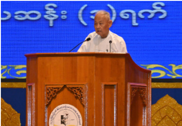
အမျိုးသားစာပေတစ်သက်တာဆုရှင် ဆရာကြီး ဒေါက်တာကျော်ဝင်း(သမိုင်းပါမောက္ခ-ငြိမ်း)က ကျေးဇူးတင်စကားပြောကြားစဉ်။

စာမျက်နှာ ၁၇ မှအဆက် အမျိုးသား စာပေတစ်သက်တာ ဆုရှင်များအဖြစ် နိုင်ငံတော်က ထိုက်တန်စွာချီးမြှောက်ခွင့်ရသည့် အတွက် အတိုင်းမသိရုဏ်ယူ ဝမ်းမြောက်မိပါကြောင်း။