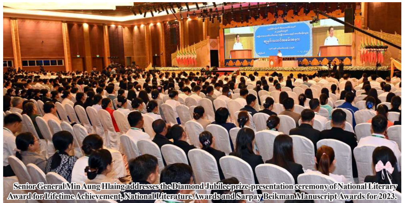
Senior General Min Aung Hlaing addresses the Diamond Jubilee prize-presentation ceremony of National Literary Award for Lifetime Achievement, National Literature Awards and Sarpay Beikman Manuscript Awards for 2023.