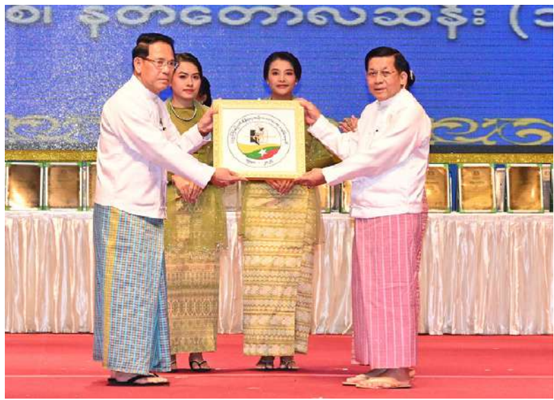
နိုင်ငံတော်စီမံအုပ်ချုပ်ရေးကောင်စီဥက္ကဋ္ဌ နိုင်ငံတော်ဝန်ကြီးချုပ် ဗိုလ်ချုပ်မှူးကြီး မင်းအောင်လှိုင်အား ပြန်ကြားရေးဝန်ကြီးဌာန ပြည်ထောင်စုဝန်ကြီး ဦးမောင်မောင်အုန်းက (၇၅)ကြိမ်မြောက် စိန်ရတုအမျိုးသားစာပေဆုအထိမ်းအမှတ် ဂုဏ်ပြုလက်ဆောင်အား ဂါရဝပြုပေးအပ်စဉ်။

၂၆ ရှေ့မှအဆက် ဆရာမကြီးများ၊ ဆုပုဂ္ဂိုလ်များ၊ စာပေ ပညာရှင်များ၊ အနုပညာရှင်များ၊ စာပေ ဝါသနာရှင်များနှင့် တာဝန်ရှိသူများ တက်ရောက်ကြသည်။ ဦးစွာ နိုင်ငံတော်စီမံအုပ်ချုပ်ရေး ကောင်စီဥက္ကဋ္ဌ နိုင်ငံတော်ဝန်ကြီးချုပ်နှင့် ဇနီးတို့က စိန်ရတုအမျိုးသားစာပေဆု အထိမ်းအမှတ်ပြခန်းကို စက်ခလုတ်နှိပ် ဖွင့်လှစ်ပေးသည်။ ယင်းနောက် နိုင်ငံတော်စီမံအုပ်ချုပ်ရေး ကောင်စီဥက္ကဋ္ဌ နိုင်ငံတော်ဝန်ကြီးချုပ်နှင့် ဇနီး၊ အခမ်းအနားတက်ရောက်လာကြသူ များသည် စိန်ရတုအမျိုးသားစာပေဆု အထိမ်းအမှတ်ပြခန်း ၂၀၂၃ ခုနှစ်အတွက် ဆုရရှိသူများ၏ အတ္ထုပ္ပတ္တိ၊ ဓာတ်ပုံ၊ ဆုရ စာအုပ်များ၊ စာအုပ်စာစောင်များနှင့် အင်းဝ ခေတ် မြန်မာစာပေဖွံ့ဖြိုးတိုးတက်မှုပြခန်း၊ စာပေဆိုင်ရာပြခန်းများကို လှည့်လည် ကြည့်ရှုကြသည်။ ယင်းနောက် အခမ်းအနားကို စတင် ကျင်းပရာ နိုင်ငံတော်စီမံအုပ်ချုပ်ရေး ကောင်စီဥက္ကဋ္ဌ နိုင်ငံတော်ဝန်ကြီးချုပ်နှင့် အခမ်းအနား တက်ရောက်လာကြသူများ သည် မြန်မာ့အသံနှင့်ရုပ်မြင်သံကြားမှ အနုပညာရှင်များ၏ “စိန်ရတုမှသည်