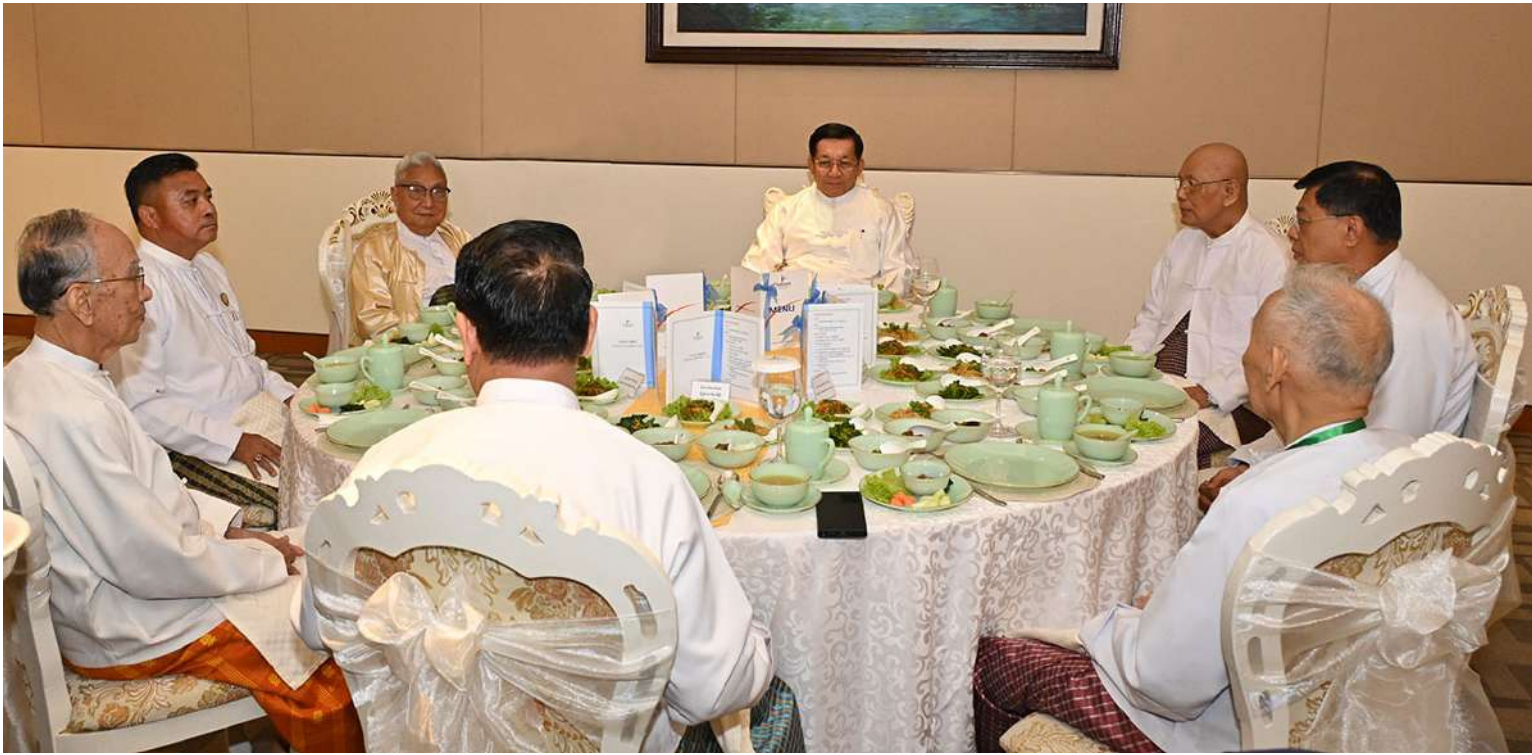
နိုင်ငံတော်စီမံအုပ်ချုပ်ရေးကောင်စီဥက္ကဋ္ဌ နိုင်ငံတော်ဝန်ကြီးချုပ် ဗိုလ်ချုပ်မှူးကြီးမင်းအောင်လှိုင်နှင့်အဖွဲ့ဝင်များက ၂၀၂၃ ခုနှစ်အတွက် အမျိုးသားစာပေတစ်သက်တာဆု၊ အမျိုးသားစာပေဆုနှင့် စာပေဗိမာန်စာမူဆုရရှိခဲ့ကြသူများ၊ အနုပညာရှင်များ၊ စာပေပညာရှင်များနှင့်အတူ ဂုဏ်ပြုနေ့လယ်စာကို အတူတကွသုံးဆောင်စဉ်။

စာမျက်နှာ ၁၈ မှအဆက် စာကောင်းပေမွန်များကို မျိုးဆက်သစ် လူငယ်များ လေ့လာနိုင်ရန်အတွက် ပြန်လည်ထုတ်ဝေသင့်ကြောင်း၊ ထို့ကြောင့် မိမိအနေဖြင့် မြန်မာနိုင်ငံဘာသာပြန် စာပေအသင်းကြီးက ထုတ်ဝေခဲ့သည့် လူထုသိပ္ပံကျမ်းတွဲများနှင့် အခြား ပြန်လည်ထုတ်ဝေဖြန့်ချိသင့်သည့် စာအုပ် စာပေများကိုလည်း ပြန်ကြားရေးဝန်ကြီး ဌာနက ပြန်လည်ထုတ်ဝေရန် လမ်းညွှန် မှာကြားထားကြောင်း၊ မြဝတီစာပေတိုက် ကလည်း ထုတ်ဝေလျက်ရှိကြောင်း။