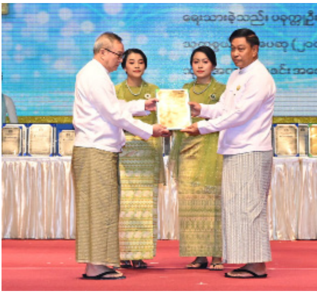
နိုင်ငံတော်စီမံအုပ်ချုပ်ရေးကောင်စီအဖွဲ့ဝင် ဗိုလ်ချုပ်ကြီးတင်အောင်စန်း ၂၀၂၃ ခုနှစ် အမျိုးသားစာပေဆု နိုင်ငံရေးစာပေဆု ဆရာနေဇင်လတ်အား ဆုပေးအပ်ချီးမြှင့်စဉ်။