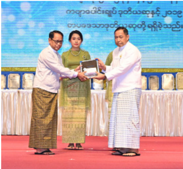
နိုင်ငံတော်စီမံအုပ်ချုပ်ရေးကောင်စီအဖွဲ့ဝင် ဒုတိယဗိုလ်ချုပ်ကြီး ရာပြည့် ၂၀၂၃ ခုနှစ် စာပေဗိမာန်စာမူဆု ကဗျာပေါင်းချုပ် ပထမဆုရ ဆရာခက်လှိုင်းကျော်အား ဆုပေးအပ်ချီးမြှင့်စဉ်။