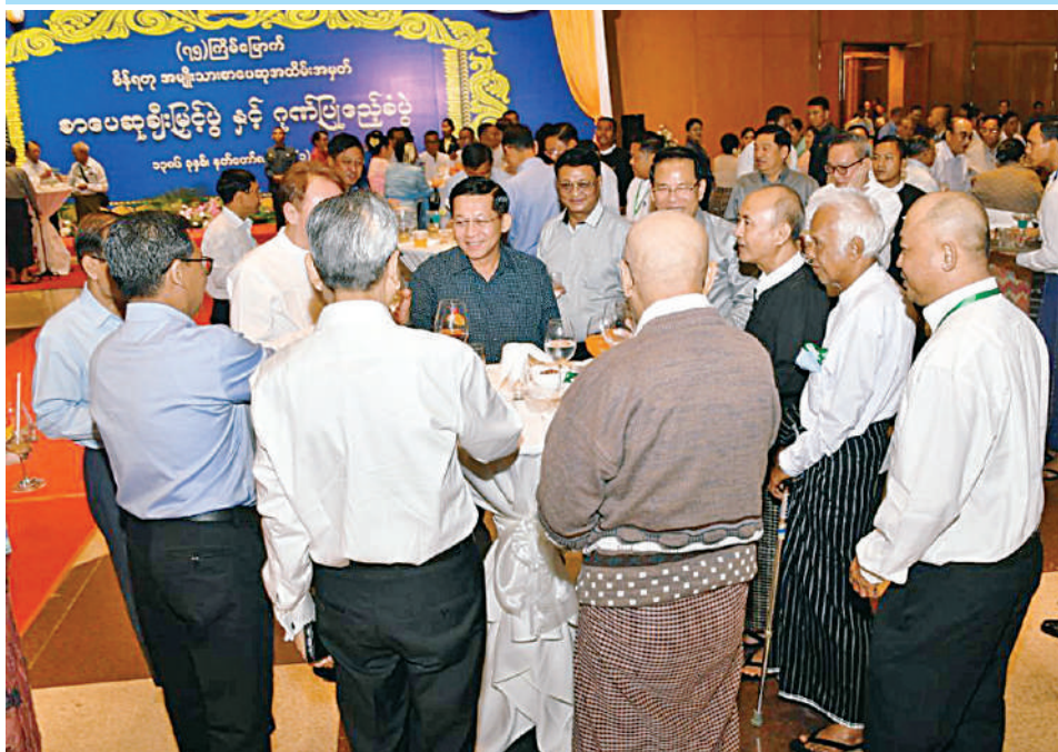
နိုင်ငံတော်စီမံအုပ်ချုပ်ရေးကောင်စီဥက္ကဋ္ဌ နိုင်ငံတော်ဝန်ကြီးချုပ် ဗိုလ်ချုပ်မှူးကြီးမင်းအောင်လှိုင်နှင့် ဇနီး ဒေါ်ကြူကြူလှတို့ ဂုဏ်ပြုညစာစားပွဲအခမ်းအနားသို့ တက်ရောက်လာကြသူများနှင့်အတူ ဂုဏ်ပြုညစာကို အတူတကွသုံးဆောင်ကြစဉ်။