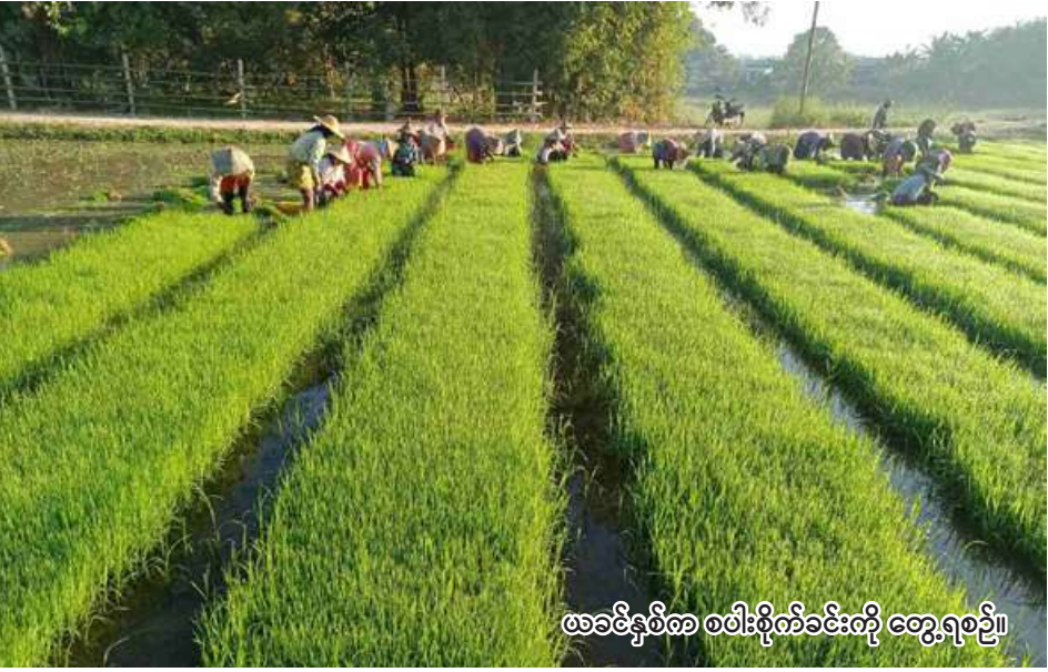
ဖာခင်နွယ်က စပါးစိုက်ခင်းကို တွေ့ရစဉ်။

ရန်ကုန် ဒီဇင်ဘာ ၁ - လာမည့် နှစ်စပါးစိုက်ပျိုး ရာသီတွင် နှစ်စပါးစိုက်ပျိုးမှုကို ဧကသုံးသန်းထိ စိုက်ပျိုးထုတ်လုပ် နိုင်ရန် မျှော်မှန်းထားကြောင်း မြန်မာနိုင်ငံ ဆန်စပါးအသင်းချုပ် ဥက္ကဋ္ဌဦးရဲမင်းအောင်က ပြောပြ၍ သိရသည်။ မြန်မာနိုင်ငံ ဆန်စပါးအသင်း ချုပ်အနေဖြင့် ဆန်စပါးကဏ္ဍဖွံ့ဖြိုး ဖြစ်ကြောင်း သိရသည်။