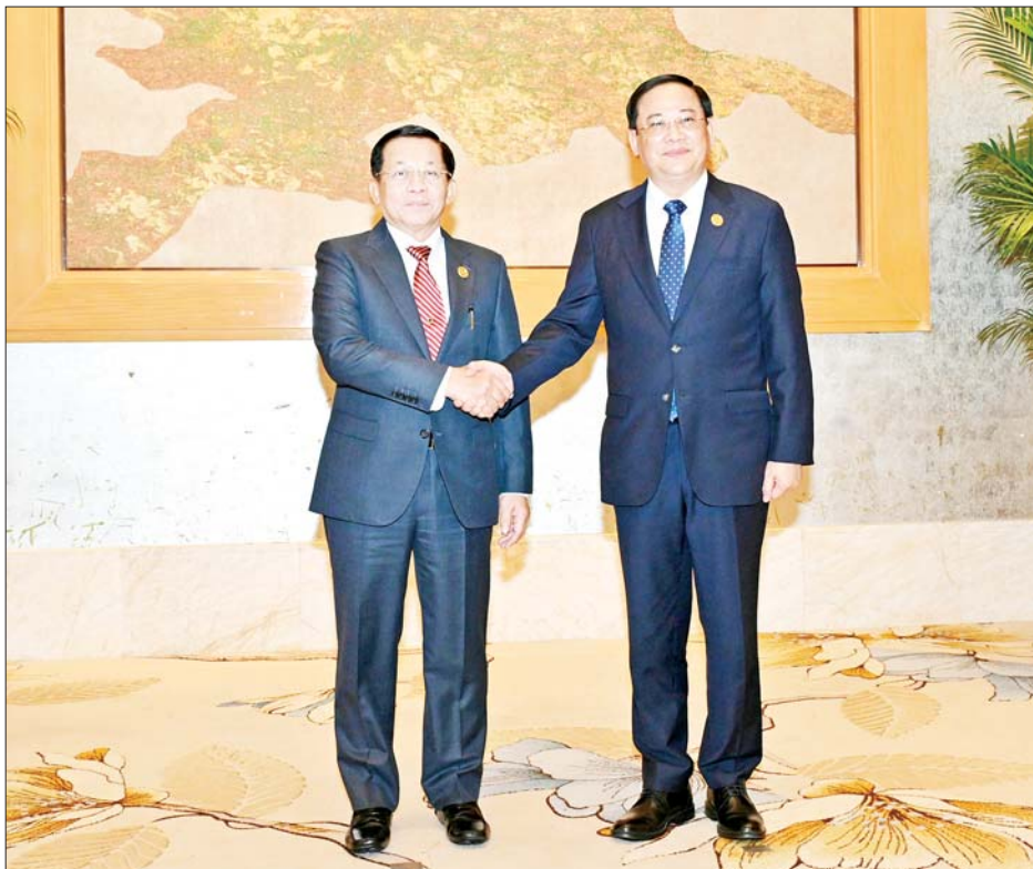
နိုင်ငံတော်စီမံအုပ်ချုပ်ရေးကောင်စီဥက္ကဋ္ဌ နိုင်ငံတော်ဝန်ကြီးချုပ် ဗိုလ်ချုပ်မှူးကြီးမင်းအောင်လှိုင် နှင့် လာအိုနိုင်ငံဝန်ကြီးချုပ် H.E. Mr. Sonexay Siphandone တို့ ရင်းနှီးနှီးနှီး နှုတ်ဆက်စဉ်။

»» စာမျက်နှာ ၃ မှ ကုန်သွယ်မှုနှင့် ရင်းနှီးမြှုပ်နှံမှု ကဏ္ဍသည် အက်မက်စ်စီးပွားရေး အတွက် အဓိကမောင်းနှင်အား တစ်ခုဖြစ်ပြီး မိမိတို့နိုင်ငံများ၏ ပြည်တွင်းအသားတင် ထုတ်ကုန် (GDP)၊ ငွေကြေးဖောင်းပွမှုနှုန်း၊ စီးပွားရေးဖွံ့ဖြိုးတိုးတက်မှုနှုန်း၊ အလုပ်အကိုင်ရရှိမှုနှင့် လူမှုဘဝ ဆိုင်ရာအချက်အလက်များအပေါ် လွှမ်းမိုးမှုရှိကြောင်း၊ ကုန်သွယ်မှု နှင့် ရင်းနှီးမြှုပ်နှံမှုဆိုင်ရာ စည်းမျဉ်း စည်းကမ်းများကို ရိုးရှင်း၍ တိကျ ခိုင်မာစေခြင်းဖြင့် ဒေသတွင်း စီးပွားရေးနှင့် ပြည်သူ့လူထု၏ လူနေမှုအဆင့်အတန်းတို့အပေါ် သိသာထင်ရှားစွာ အကျိုးပြုစေ မည်ဖြစ်ကြောင်း။