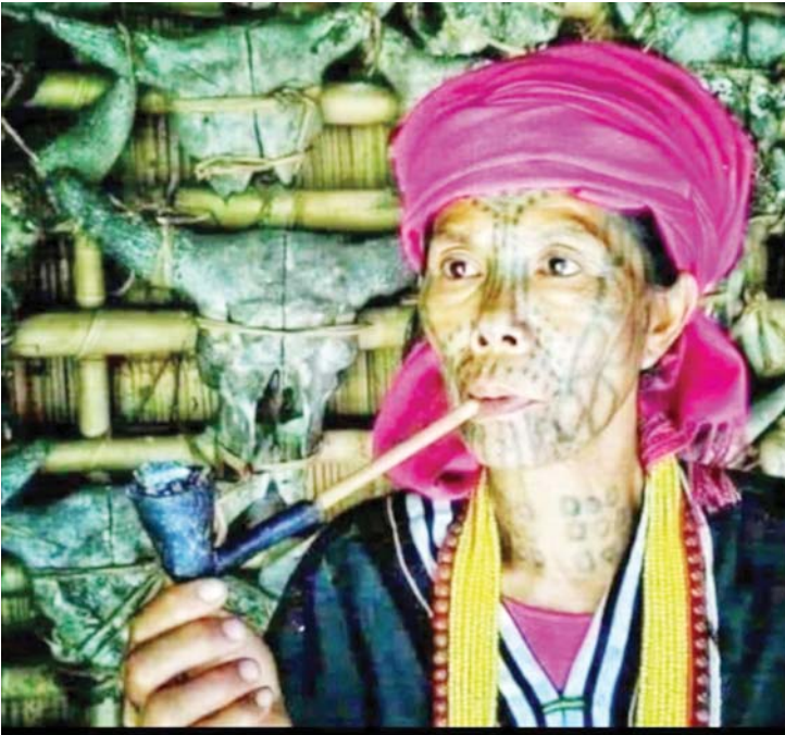
လုံယူး ခေါ် ကျောက်ပြင်ချီ အလှူပွဲပြုလုပ်ခဲ့သူက သူ၏အိမ်နံရံတွင် အသုံးပြုခဲ့ သောနွား၊ နွားနောက်ဦးခေါင်းခွံများ ချိတ်ဆွဲထားသည်ကို တွေ့ရစဉ်။

ကာ အလှူပွဲများပြုလုပ်သည်ဟု ဆိုကြ လေရာ ယေဘုယျဖော်ပြချက်သာဖြစ်၏။ အမှန်အားဖြင့်ကား ကျောက်ပြင်ချီ အလှူပွဲကြီးများတွင် ထိုအကောင်ကြီး တစ်ကောင် သုံးစွဲလေတိုင်း ဝက်၊ ဆိတ်၊ ကြက်၊ ငှက် စသည်ဖြင့် တစ်မျိုးလျှင် အရေ အတွက် ဆယ်ဂဏန်းမျှပင် အချိုးကျ အသုံးပြုကြရသည့်အပြင် ပတ်ဝန်းကျင်ရှိ ရွာများနှင့် ဆွေမျိုးရွာများအားလုံး လာရောက်စားသောက်သုံးဆောင်ကြရန် ဆန်၊ ခေါင်အိုး၊ ဟင်းသီးဟင်းရွက်မျိုးစုံ၊ ထင်းခြောက် စသည်ဖြင့် ကြိုတင်ရှာဖွေ ထားကြရသည်။ လုံယူးတစ်ပွဲလျှင် အဘယ်မျှကုန်ကျမည်ကို ခန့်မှန်းကြည့် နိုင်သည်။ သောက်စားကုန်ရက်ပြုမည့် ပွဲလာဧည့်ပရိသတ်များသည် ညအိပ်သူ များချည်းဖြစ်၍ ထိုသူတို့ကို ချက်ပြုတ် ကျွေးမွေး တည်းခိုအိပ်စက်စရာပေးရန် နှင့် ဝိုင်းဝန်းလှုပ်ဆောင်ပေးသူများ၊ ဧည့်ခံ ပေးသူများကို စည်းရုံးရ၏။ အကွက် စေ့စွာ အလစ်အဟာမရှိအောင် စီမံ ခန့်ခွဲရ၏။ ထိုအချက်များကြောင့်လည်း