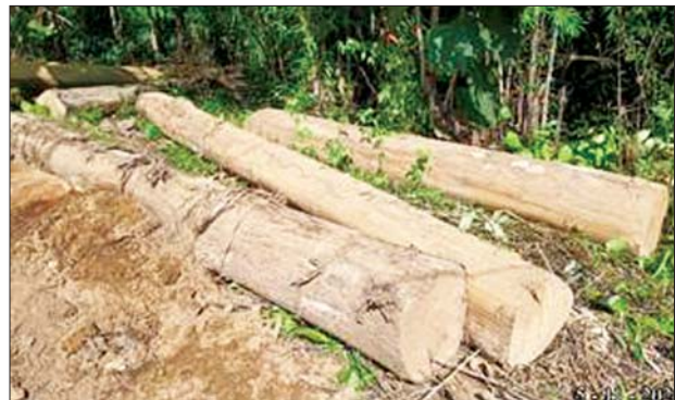
ပဲခူးတိုင်းဒေသကြီး၌ သိမ်းဆည်းရမိမှု။

၁၄၀၀၀၀)ကို ပို့ကုန်သွင်းကုန်ဥပဒေအရလည်းကောင်း၊ မင်းဘူးခရိုင် စလင်းမြို့နယ် စလင်း-စေတုတ္တရာလမ်းဆုံ စစ်ဆေးရေးဂိတ်၌ ယာဉ် တစ်စီးပေါ်မှ တရားဝင်စာရွက်စာတမ်း အထောက်အထား တင်ပြ နိုင်ခြင်းမရှိသည့် တရားမဝင်စက်သုံးဆီ ဓာတ်ဆီ ၁၁ ပီပါ၊ ဒီဇယ်တစ် ပီပါ (ခန့်မှန်းတန်ဖိုးငွေကျပ် ၅၄၉၆၈၀၀)နှင့် အဆိုပါ စက်သုံးဆီများ တင်ဆောင်လာသည့် Canter Truck တစ်စီး (ခန့်မှန်းတန်ဖိုးငွေကျပ် ၃၀၀၀၀၀၀)ကို ရေနံထွက်ပစ္စည်းဆိုင်ရာဥပဒေအရလည်းကောင်း စုစုပေါင်း ခန့်မှန်းတန်ဖိုးငွေကျပ် ၃၆၈၉၆၈၀၀ကို သိမ်းဆည်းအရေးယူ ဆောင်ရွက်လျက်ရှိသည်။