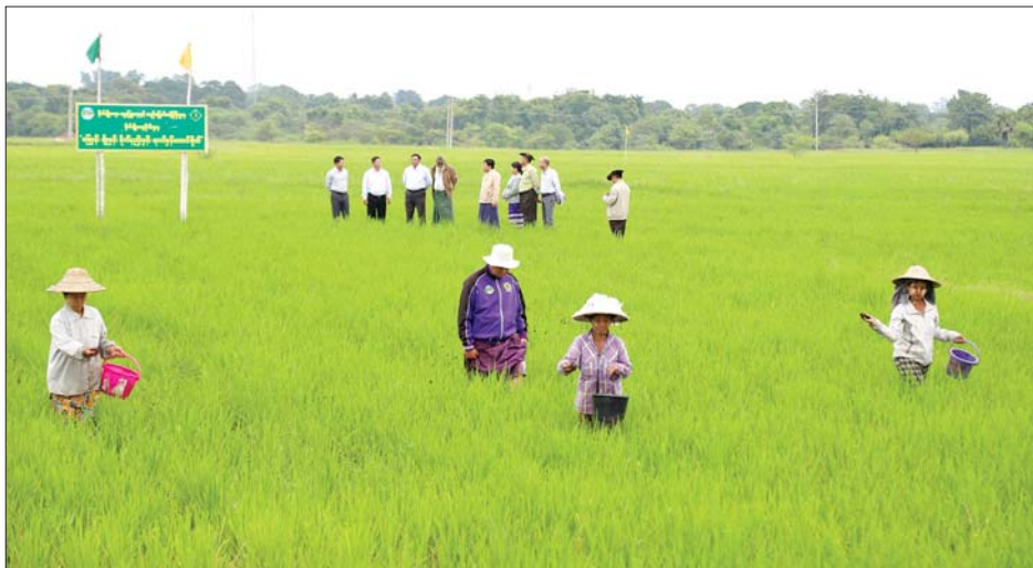
ထိုမှတစ်ဆင့် သာစည်မြို့နယ်ရှိ သောင်ရမ်း- မင်းလှကန်သို့ ရောက်ရှိစစ်ဆေးပြီး ပြည်ထောင်စု ဝန်ကြီးက သောင်ရမ်းကန်နှင့် မင်းလှကန်၏ ရေခြားကန်ပေါင် ပြန်လည်ပြုပြင်ခြင်းလုပ်ငန်းကို လာမည့် နွေစပါးရာသီစိုက်ပျိုးရေးပေးပေးပြီး ကန်ရေ လျော့နည်းချိန်တွင် ဆောင်ရွက်ရန်နှင့် ဘဏ္ဍာငွေအလေ့ အလွင့်မရှိဆောင်ရွက်နိုင်ရန် ဆွေးနွေးမှာကြားသည်။ ယင်းနောက် ဝမ်းတွင်းမြို့နယ် မြေတိုင်ကန် မှာကြားခဲ့ကြောင်း သိရသည်။ သတင်းစဉ်

စိုက်ပျိုးရေး၊ မွေးမြူရေးနှင့် ဆည်မြောင်း ဝန်ကြီးဌာန ပြည်ထောင်စုဝန်ကြီး ဦးမင်းနောင်သည် ယနေ့နံနက်ပိုင်းတွင် မန္တလေးတိုင်းဒေသကြီး မိတ္ထီလာမြို့နယ် ထမုန်ကန်ကျေးရွာအုပ်စု မိုးစပါး နည်းပညာပေးစံပြစိုက်ကွင်း၌ ကျင်းပသည့် ဓာတ်မြေဩဇာကြပ်ပတ်ပွဲသို့ တက်ရောက်လာကြ သည့် တောင်သူများနှင့် ရင်းနှီးခင်မင်စွာတွေ့ဆုံ၍ စိုက်ပျိုးထုတ်လုပ်မှု အလားအလာကောင်းသော ဒေသများကို အားပေးထောက်ပံ့ကူညီမှုများ ဆောင် ရွက်ပေးလျက်ရှိပါကြောင်း၊ မျိုးစေ့ထုတ်လုပ်ငန်းရှင် များနှင့် တောင်သူများအကြား မျှတသည့်အကျိုး စီးပွားဖြစ်ထွန်းစေရေး အပြန်အလှန်ပူးပေါင်းဆောင် ရွက်ခြင်းဖြင့် ရေရှည်တည်တံ့သော မျိုးစေ့ထုတ် လုပ်ငန်းများ ဖွံ့ဖြိုးလားစေရေး ကြိုးပမ်းကြစေလို ကြောင်း ဆွေးနွေးပြောကြားပြီး မိုးစပါးခင်းတွင် တောင်သူများ စုပေါင်း၍ ဓာတ်မြေဩဇာကြပ်ပတ်မှုကို ကွင်းဆင်းကြည့်ရှုအားပေးကြသည်။