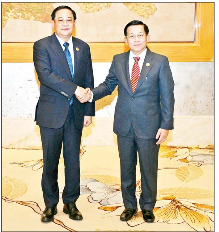
နိုင်ငံတော်စီမံအုပ်ချုပ်ရေးကောင်စီဥက္ကဋ္ဌ နိုင်ငံတော်ဝန်ကြီးချုပ် ဗိုလ်ချုပ်မှူးကြီး မင်းအောင်လှိုင်နှင့် လာအိုနိုင်ငံဝန်ကြီးချုပ် H.E. Mr. Sonexay Siphandone တို့ ရင်းရင်းနှီးနှီးနှုတ်ဆက်စဉ်။

ထို့နောက် (၁၁) ကြိမ်မြောက် ကမ္ဘောဒီးယား- လာအို - မြန်မာ - ဗီယက်နမ် ပူးပေါင်းဆောင်ရွက်မှု (စီအယ်လ်အမ်ပီ) ထိပ်သီးအစည်းအဝေးဥက္ကဋ္ဌ နိုင်ငံတော်စီမံအုပ်ချုပ်ရေးကောင်စီဥက္ကဋ္ဌ နိုင်ငံတော်ဝန်ကြီးချုပ်က အဖွဲ့အမှာစကားပြောကြားရာတွင် (၈) ကြိမ်မြောက် ဂျီအမ်အက်စ် ထိပ်သီးအစည်းအဝေးနှင့် ဆက်စပ်ကျင်းပသည့် (၁၁) ကြိမ်မြောက် စီအယ်လ်အမ်ပီထိပ်သီးအစည်းအဝေးသို့ ပါဝင်