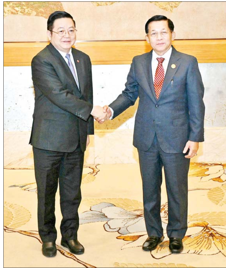
နိုင်ငံတော်စီမံအုပ်ချုပ်ရေးကောင်စီဥက္ကဋ္ဌ နိုင်ငံတော်ဝန်ကြီးချုပ် ဗိုလ်ချုပ်မှူးကြီး မင်းအောင်လှိုင်နှင့် အာဆီယံအတွင်းရေးမှူးချုပ် H.E. Dr. KAO KIM HOURN တို့ ရင်းရင်းနှီးနှီးနှုတ်ဆက်စဉ်။

ဆက်မှုများနှင့် အထူးစီးပွားရေးဇုန်များမှ တစ်ဆင့် စက်မှုနည်းပညာဆိုင်ရာအခြေခံအဆောက်အအုံများနှင့် စက်မှုအဆောက်အအုံများကို တည်ဆောက်၊ အဆင့်မြှင့်တင်ပေးရန် လိုအပ်ကြောင်း။