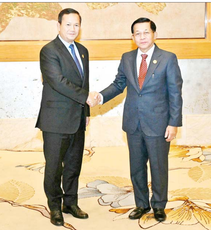
နိုင်ငံတော်စီမံအုပ်ချုပ်ရေးကောင်စီဥက္ကဋ္ဌ နိုင်ငံတော်ဝန်ကြီးချုပ် ဗိုလ်ချုပ်မှူးကြီး မင်းအောင်လှိုင်နှင့် ကမ္ဘောဒီးယားနိုင်ငံဝန်ကြီးချုပ် H.E. Mr. Hun Manet တို့ ရင်းရင်းနှီးနှီးနှုတ်ဆက်စဉ်။

နေပြည်တော် နိုဝင်ဘာ ၇ (၁၁) ကြိမ်မြောက် ကမ္ဘောဒီးယား-လာအို-မြန်မာ-ဗီယက်နမ် ပူးပေါင်းဆောင်ရွက်မှု (စီအယ်လ်အမ်ပီ) ထိပ်သီးအစည်းအဝေး (11 th Cambodia - Lao PDR - Myanmar - Vietnam (CLMV) Summit)ကို ယနေ့မုန်လွင်ပိုင်တွင် တရုတ်ပြည်သူ့သမ္မတနိုင်ငံ ကူမင်းမြို့ရှိ Wyndham Grand Hotel ၌ ကျင်းပရာ ထိပ်သီးအစည်းအဝေးဥက္ကဋ္ဌ နိုင်ငံတော်စီမံအုပ်ချုပ်ရေးကောင်စီဥက္ကဋ္ဌ နိုင်ငံတော်ဝန်ကြီးချုပ် ဗိုလ်ချုပ်မှူးကြီး မင်းအောင်လှိုင် တက်ရောက်အမှာစကားပြောကြားသည်။ အစည်းအဝေးသို့ အဖွဲ့ဝင်နိုင်ငံများမှ ဝန်ကြီးချုပ်များဖြစ်ကြသည့် ကမ္ဘောဒီးယားနိုင်ငံဝန်ကြီးချုပ် H.E. Mr. Hun Manet၊ လာအိုနိုင်ငံဝန်ကြီးချုပ် H.E. Mr. Sonexay Siphandone၊ ဗီယက်နမ်နိုင်ငံဝန်ကြီးချုပ် H.E. Mr. Pham Minh Chich၊ အာဆီယံအတွင်းရေးမှူးချုပ် H.E. Dr. KAO KIM HOURN၊ အဖွဲ့ဝင်နိုင်ငံများမှ ဝန်ကြီးများ၊ ဒုတိယဝန်ကြီးများနှင့် အဆင့်မြင့်အရာရှိကြီးများ၊ တာဝန်ရှိသူများ တက်ရောက်ကြသည်။ ဦးစွာ (၁၁) ကြိမ်မြောက် ကမ္ဘောဒီးယား-လာအို-မြန်မာ-ဗီယက်နမ်ပူးပေါင်းဆောင်ရွက်မှု (စီအယ်လ်အမ်ပီ) ထိပ်သီးအစည်းအဝေးဥက္ကဋ္ဌ နိုင်ငံတော်စီမံအုပ်ချုပ်ရေးကောင်စီဥက္ကဋ္ဌ နိုင်ငံတော်ဝန်ကြီးချုပ် ဗိုလ်ချုပ်မှူးကြီး မင်းအောင်လှိုင်သည် ထိပ်သီးအစည်းအဝေးသို့ တက်ရောက်ရန် ရောက်ရှိလာကြသည့် အဖွဲ့ဝင်နိုင်ငံများမှ ဝန်ကြီးချုပ်များနှင့် အဖွဲ့ဝင်များကို ကြိုဆိုနှုတ်ဆက်ပြီး စုပေါင်းမှတ်တမ်းတင်ဓာတ်ပုံရိုက်ကြသည်။