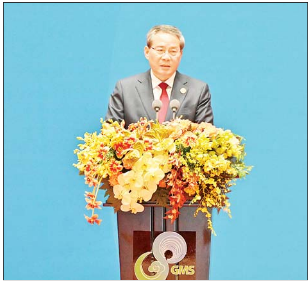
တရုတ်ပြည်သူ့သမ္မတနိုင်ငံ ဝန်ကြီးချုပ် H.E. Mr. Li Qiang က အဖွင့်အမှာစကားပြောကြားစဉ်။

နိုင်ငံတော်ဝန်ကြီးချုပ်က ဒေသ တွင်း စီးပွားရေးလုပ်ငန်းရှင်များ ကပါဝင်ဝန်းပွဲပေါင်းဆောင်ရွက် ကြရန် လိုအပ်မှုနှင့်ပတ်သက်၍ ပြောကြားရာ၌ “တစ်ချိန်တည်း မှာပဲ တီထွင်ဆန်းသစ်မှုများဟာ မိမိနိုင်ငံရဲ့ ရေမြေသဘာဝ၊ ပထဝီ အနေအထားတွေနဲ့ ကိုက်ညီဖို့လို တဲ့အပြင် အစိုးရ၊ ဖွံ့ဖြိုးမှုမိတ်ဖက် များ၊ ပုဂ္ဂလိကနဲ့ ဒေသန္တရအစိုးရ များအပြင် အသိပညာရှင်၊ အတတ် ပညာရှင်တွေ၊ စွန့်ခွာတီထွင်သူတွေ နဲ့ စီးပွားရေးလုပ်ငန်းရှင်များကပါ ဝင်ဝန်းပွဲပေါင်း ဆောင်ရွက်ကြရ မှာဖြစ်ပါတယ်” ဟု ပြောကြားသည်။