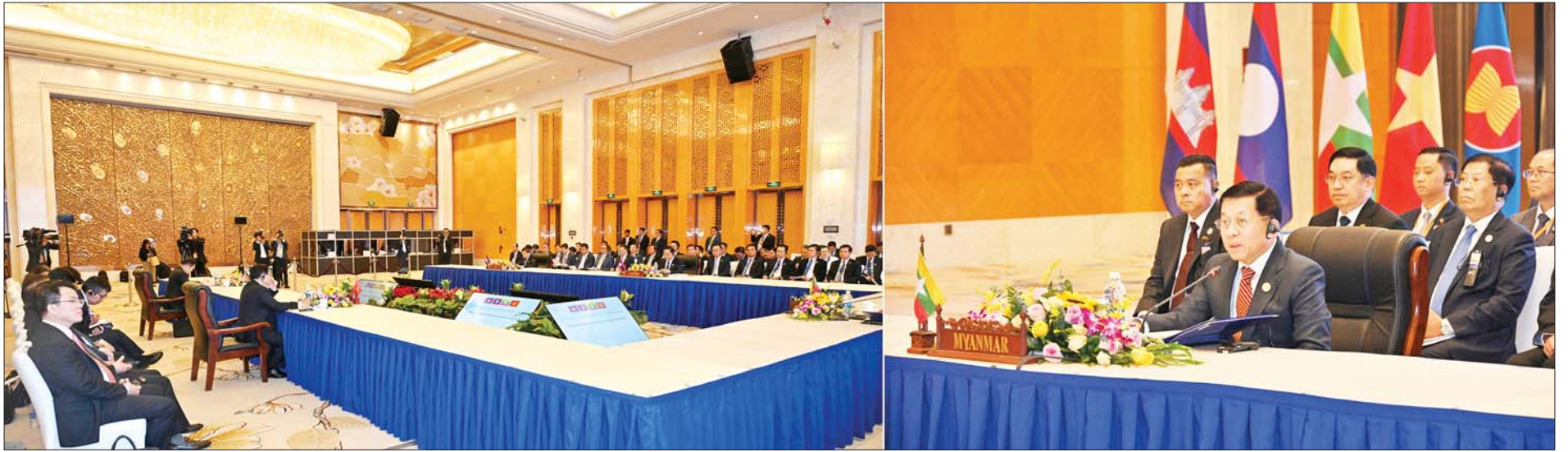
(၁၁) ကြိမ်မြောက် ကမ္ဘောဒီးယား-လာအို-မြန်မာ-ဗီယက်နမ် ပူးပေါင်းဆောင်ရွက်မှု (စီအယ်လ်အမ်ပီ) ထိပ်သီးအစည်းအဝေးဥက္ကဋ္ဌ နိုင်ငံတော်စီမံအုပ်ချုပ်ရေးကောင်စီဥက္ကဋ္ဌ နိုင်ငံတော်ဝန်ကြီးချုပ် ဗိုလ်ချုပ်မှူးကြီးမင်းအောင်လှိုင် (၁၁) ကြိမ်မြောက် ကမ္ဘောဒီးယား-လာအို- မြန်မာ- ဗီယက်နမ် ပူးပေါင်းဆောင်ရွက်မှု (စီအယ်လ်အမ်ပီ) ထိပ်သီးအစည်းအဝေးတွင် အမှာစကားပြောကြားစဉ်။