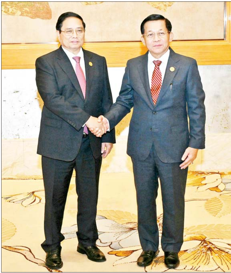
နိုင်ငံတော်စီမံအုပ်ချုပ်ရေးကောင်စီဥက္ကဋ္ဌ နိုင်ငံတော်ဝန်ကြီးချုပ် ဗိုလ်ချုပ်မှူးကြီး မင်းအောင်လှိုင်နှင့် ဗီယက်နမ်နိုင်ငံဝန်ကြီးချုပ် H.E. Mr. Pham Minh Chich တို့ ရင်းရင်းနှီးနှီးနှုတ်ဆက်စဉ်။

ကပ်ရောဂါဆိုးကြောင့် စီအယ်လ်အမ်စီနိုင်ငံများ၏ စက်မှုကဏ္ဍသည် သိသာထင်ရှားစွာထိခိုက်ခဲ့ရကြောင်း၊ အဆိုပါကဏ္ဍ ပြန်လည်ဖွံ့ဖြိုးတိုးတက်ရေးအတွက် မိမိတို့အနေဖြင့် စီးပွားရေးစင်္ကြံများ၊ စီးပွားရေးစင်္ကြံများအကြား ချိတ်ဆက်မှုများနှင့် အထူးစီးပွားရေး