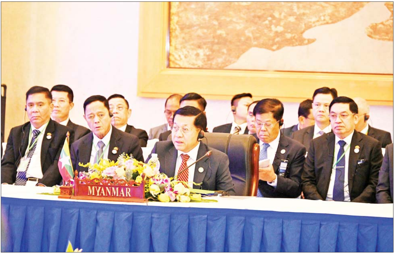
နိုင်ငံတော်စီမံအုပ်ချုပ်ရေးကောင်စီဥက္ကဋ္ဌ နိုင်ငံတော်ဝန်ကြီးချုပ် ဗိုလ်ချုပ်မှူးကြီးမင်းအောင်လှိုင် (၁၀)ကြိမ်မြောက် ဧရာဝတီ- ကျောက်ဖရား- မဲခေါင် စီးပွားရေးပူးပေါင်းဆောင်ရွက်မှု မဟာဗျူဟာ(အက်မက်စ်)ထိပ်သီးအစည်းအဝေးတွင် အမှာစကားပြောကြားစဉ်။

ရှေးဖူးမှ ဦးစွာ နိုင်ငံတော်စီမံအုပ်ချုပ်ရေး ကောင်စီဥက္ကဋ္ဌ နိုင်ငံတော် ဝန်ကြီးချုပ် ဗိုလ်ချုပ်မှူးကြီး မင်းအောင်လှိုင်သည် ထိပ်သီး အစည်းအဝေးသို့ တက်ရောက်ရန် ရောက်ရှိလာရာ အက်မက်စ် ထိပ်သီးအစည်းအဝေး ဥက္ကဋ္ဌ လာအိုနိုင်ငံဝန်ကြီးချုပ်က ကြိုဆို နှုတ်ဆိုပြီး တက်ရောက်လာကြ သည့် အဖွဲ့ဝင်နိုင်ငံများမှ ဝန်ကြီး ချုပ်များနှင့်အတူ စုပေါင်းမှတ် တမ်းတင်ဓာတ်ပုံရိုက်ကြသည်။ အဖွဲ့ဝင်နိုင်ငံများ ပြောကြား ထိုနောက် (၁၀)ကြိမ်မြောက် ဧရာဝတီ-ကျောက်ဖရား-မဲခေါင် စီးပွားရေး ပူးပေါင်းဆောင်ရွက်မှု မဟာဗျူဟာ(အက်မက်စ်)ထိပ်သီး အစည်းအဝေးဥက္ကဋ္ဌ လာအိုနိုင်ငံ ဝန်ကြီးချုပ်က အဖွဲ့ဝင်နိုင်ငံများကို လည်းကောင်း၊ ကမ္ဘောဒီးယားနိုင်ငံ ဝန်ကြီးချုပ်က အမှာစကားကို လည်းကောင်း ပြောကြားကြသည်။ ယင်းနောက် နိုင်ငံတော် စီမံအုပ်ချုပ်ရေးကောင်စီ ဥက္ကဋ္ဌ နိုင်ငံတော်ဝန်ကြီးချုပ်က အမှာ စကား ပြောကြားရာတွင် ၂၀၂၃ ခုနှစ်က မြန်မာနိုင်ငံ ပုဂံမြို့တွင် အခြေတည်ခဲ့သည့် အက်မက်စ် ပူးပေါင်းဆောင်ရွက်မှုသည် ယခု ဆိုလျှင် ၂၁ နှစ် သက်တမ်းရှိခဲ့ပြီ