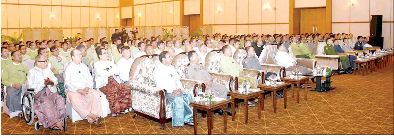
နိုင်ငံတော်စီမံအုပ်ချုပ်ရေးကောင်စီအဖွဲ့ဝင် ပြည်ထောင်စုဝန်ကြီး ဒုတိယဗိုလ်ချုပ်ကြီးရာပြည့် (၃၆)နှစ်မြောက် အထွေထွေအုပ်ချုပ်ရေးဦးစီးဌာန နှစ်ပတ်လည်နေ့အခမ်းအနားတွင် အမှာစကားပြောကြားစဉ်။