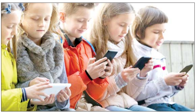
ကလေးနှင့် ၎င်း၏မိဘ သို့မဟုတ် မဟုတ်ပေ။ အုပ်ထိန်းသူများကို ပြစ်ဒဏ်ချမှတ်မည် အဆိုပါဥပဒေကို လွှတ်တော်က

ယင်းသို့ဆိုရှယ်မီဒီယာအသုံးပြုခွင့်ကို ကလေးများအား ပိတ်ပင်ရခြင်းမှာဆိုရှယ်မီဒီယာသည် ကလေးများအတွက် အန္တရာယ်ရှိခြင်းကြောင့် ဖြစ်ကြောင်း ၎င်းက ပြောသည်။ ထို့ပြင် ဥပဒေပြဋ္ဌာန်းပြီးပါက အသက်မပြည့်မီသည့် ကလေးများကို အွန်လိုင်းပလက်ဖောင်း ဝင်ရောက်ရန်ခွင့်ပြုသည့် မည်သည့် ဆိုရှယ်မီဒီယာကိုမဆို ဥပဒေနှင့်အညီ ပြစ်ဒဏ်ချမှတ်သွားမည်ဖြစ်ကြောင်း သိရသည်။ သို့သော် အဆိုပါအွန်လိုင်းပလက်ဖောင်းသို့ ဝင်ရောက်ရန်ကြိုးပမ်းသည့်