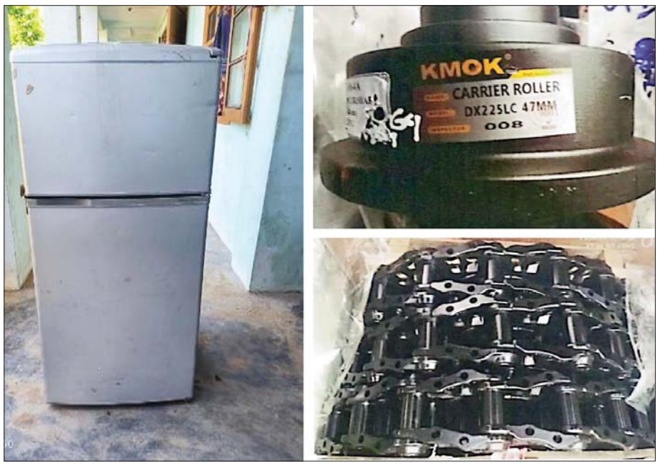
အေးရှားဝေါလ်ကုန်သေတ္တာစစ်ဆေးရေးစခန်း၌ ဖမ်းဆီးရမိမှု။

တရားမဝင်ကုန်သွယ်မှုဆိုသည်မှာ World Trade Organization (WTO) ကမ္ဘာ့ကုန်သွယ်ရေးအဖွဲ့ကြီးက တရားမဝင်ကုန်သွယ်မှုကို အဓိပ္ပာယ်ဖွင့်ဆိုရာတွင် “နိုင်ငံတကာ ဥပဒေများအရ သတ်မှတ်ထားသည့် တရားမဝင်ကုန်ပစ္စည်းများကို ထုတ်လုပ်ခြင်း၊ ဝယ်ယူခြင်း၊ ရောင်းချခြင်း၊ ပို့ဆောင်ခြင်း၊ ရွှေ့ပြောင်းခြင်း၊ လွှဲပြောင်းခြင်း၊ လက်ခံရရှိခြင်း၊ လက်ဝယ်ထားရှိခြင်း (သို့မဟုတ်) ဖြန့်ဖြူးခြင်းနှင့် အဆိုပါဆောင်ရွက်ချက်များကို အားပေးရန် ရည်ရွယ်သည့် မည်သည့်လုပ်ဆောင်မှုကိုမဆို တရားမဝင်ကုန်သွယ်မှု”ဟု ဖွင့်ဆိုထားပါသည်။