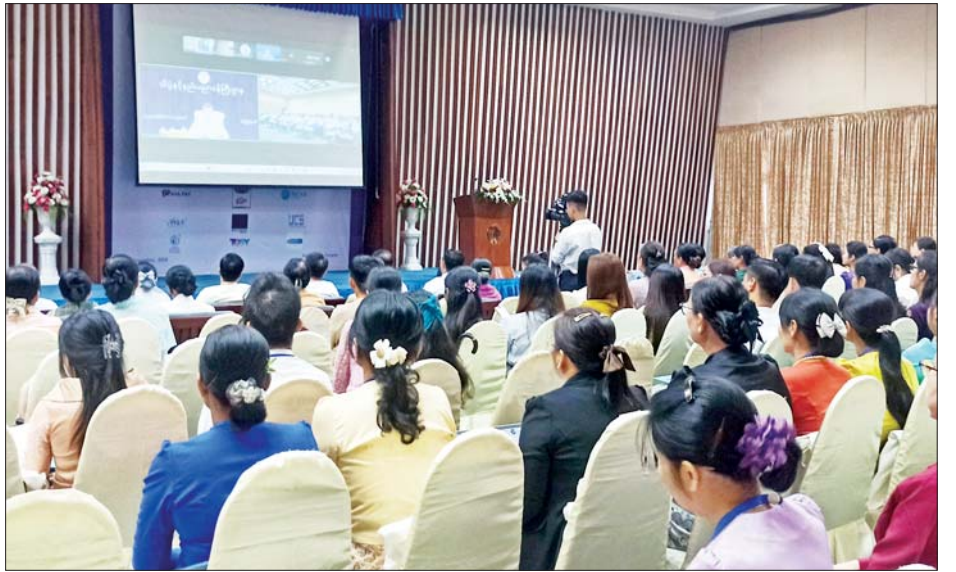
Advanced Information Technologies(ICAIT 2024) ညီလာခံသို့ ဂျပန်နိုင်ငံနှင့် အိန္ဒိယသမ္မတနိုင်ငံ တို့မှ ပါမောက္ခများ၊ မြန်မာနိုင်ငံကွန်ပျူတာအသင်း များနှင့် အင်ဂျင်နီယာအသင်းများမှ တာဝန်ရှိသူများ၊ ကွန်ပျူတာတက္ကသိုလ်များနှင့် နည်းပညာတက္ကသိုလ် များမှ ပါမောက္ခချုပ်များ၊ ဒုတိယပါမောက္ခချုပ်များ၊ သုတေသီများနှင့် စာတမ်းဖတ်ကြားသူများ တက်ရောက်ခဲ့ကြပြီး ညီလာခံဖြစ်မြောက်ရေး အတွက် သိပ္ပံနှင့်နည်းပညာဝန်ကြီးဌာန၊ ရန်ကုန်တိုင်း ဒေသကြီးအစိုးရအဖွဲ့နှင့် IT ကမ္ဘာ့ဇာတိများက ပူးပေါင်း ပါဝင်ဆောင်ရွက်ခဲ့ကြကြောင်း သိရသည်။