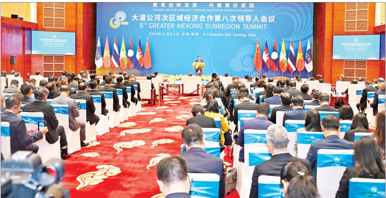
နိုင်ငံတော်စီမံအုပ်ချုပ်ရေးကောင်စီဥက္ကဋ္ဌ နိုင်ငံတော်ဝန်ကြီးချုပ် ဗိုလ်ချုပ်မှူးကြီးမင်းအောင်လှိုင် အဋ္ဌမအကြိမ် မဟာမဲခေါင်ဒေသခွဲ (ဂျီအမ်အက်စ်) ထိပ်သီးအစည်းအဝေးတွင် တက်ရောက် အမှာစကားပြောကြားစဉ်။

တက်ရောက် အစည်းအဝေးသို့ တရုတ် ပြည်သူ့သမ္မတနိုင်ငံ ဝန်ကြီးချုပ် H.E. Mr. Li Qiang၊ ကမ္ဘောဒီးယား ဘုရင့်နိုင်ငံဝန်ကြီးချုပ် H.E. Mr. Hun Manet ၊ လာအိုပြည်သူ့ ဒီမိုကရက်တစ် သမ္မတနိုင်ငံ ဝန်ကြီးချုပ် H.E. Mr. Sonexay Siphandone ၊ ထိုင်းနိုင်ငံဝန်ကြီး ချုပ် H.E. Ms. Paetongtarn Shinawatra ၊ ဗီယက်နမ် ဆိုရှယ်လစ်သမ္မတနိုင်ငံ ဝန်ကြီး ချုပ် H.E. Mr. Pham Minh Chich ၊ အာရှဖွံ့ဖြိုးရေးဘဏ် ဥက္ကဋ္ဌ Mr. Masatsugu Asakawa နှင့် မဟာမဲခေါင်ဒေသခွဲ နိုင်ငံများမှ ဝန်ကြီးများ၊ ဒုတိယဝန်ကြီးများ နှင့် အဆင့်မြင့်အရာရှိကြီးများ၊ တာဝန်ရှိသူများ တက်ရောက်ကြ သည်။ အဋ္ဌမအကြိမ် မဟာ