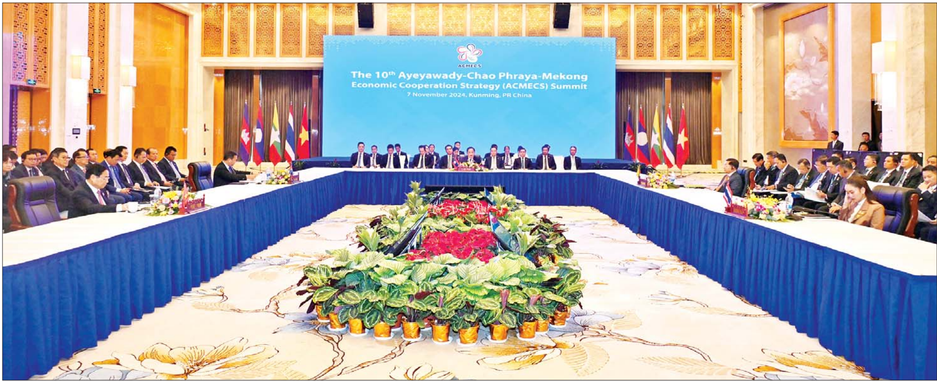
(၁၀)ကြိမ်မြောက် ဧရာဝတီ - ကျောက်ဖရား - မဲခေါင် စီးပွားရေးပူးပေါင်းဆောင်ရွက်မှု မဟာဗျူဟာ(အက်မက်စ်)ထိပ်သီးအစည်းအဝေး ကျင်းပစဉ်။