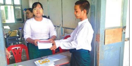
ဒေးဒရ်မြို့နယ်မှ ကျောင်းတစ်ကျောင်း၌ ကျောင်းအပ်နေသည့် ကျောင်းသားတစ်ဦးအား စာအုပ်များ ထုတ်ပေးနေစဉ်။ (ဒေးဒရ်မြို့နယ်၌ အခြေခံပညာကျောင်း ၂၂၁ ကျောင်းတွင် ကျောင်းအပ်လက်ခံလျက်ရှိကြောင်း သိရသည်။) အေဇာလင်း