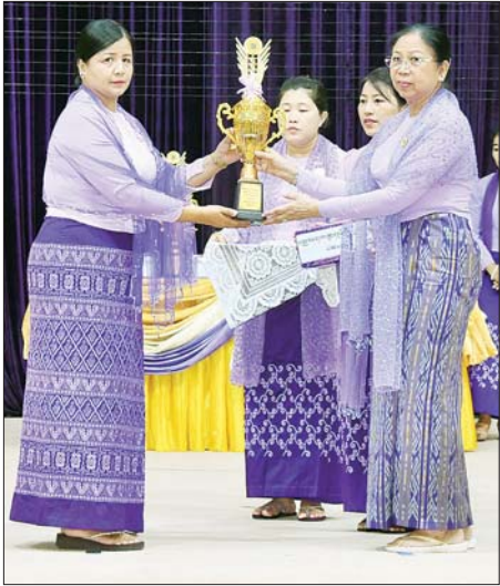
မြန်မာနိုင်ငံ မိခင်နှင့်ကလေး စောင့်ရှောက်ရေးအသင်း ဂုဏ်ထူးဆောင် နာယက နိုင်ငံတော်စီမံအုပ်ချုပ်ရေးကောင်စီဥက္ကဋ္ဌ နိုင်ငံတော်ဝန်ကြီး ချုပ်၏ဇနီး ဒေါ်ကြူကြူလှ ပညာရေးကဏ္ဍ လှုပ်ရှားမှုအတွက် ပထမဆုရရှိသည့် ပဲခူးတိုင်းဒေသကြီးအား ဆုပေးအပ်ချီးမြှင့်စဉ်။