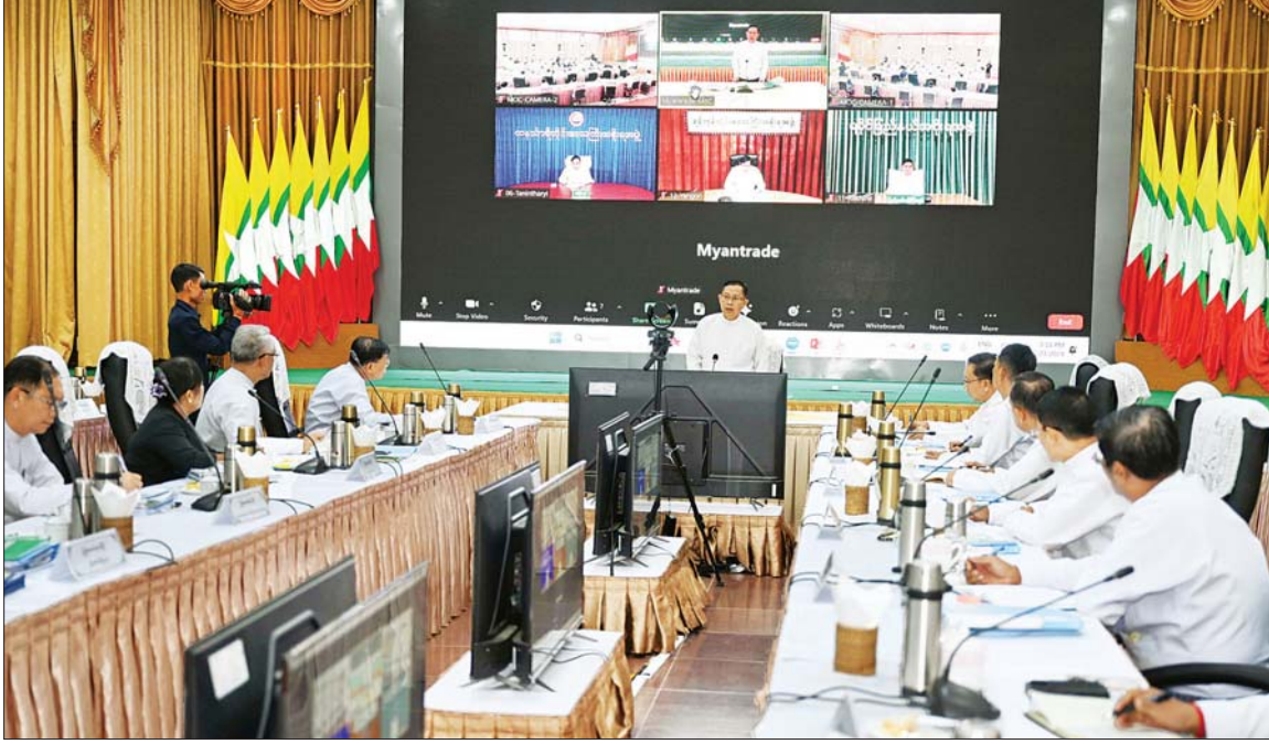
နိုင်ငံတော်စီမံအုပ်ချုပ်ရေးကောင်စီ ဒုတိယဥက္ကဋ္ဌ ဒုတိယဝန်ကြီးချုပ် ဒုတိယဗိုလ်ချုပ်မျိုးကြီး စိုးဝင်း မြန်မာအထူးစီးပွားရေးဇုန်ဆိုင်ရာ ဗဟိုအဖွဲ့၏ ၂၀၂၄ - ၂၀၂၅ ဘဏ္ဍာနှစ် ပထမအကြိမ်အစည်းအဝေးတွင် အမှာစကားပြောကြားစဉ်။

နေပြည်တော် မေ ၂၃ မြန်မာ အထူးစီးပွားရေးဇုန် ဆိုင်ရာ ဗဟိုအဖွဲ့၏ ၂၀၂၄-၂၀၂၅ ဘဏ္ဍာနှစ် ပထမအကြိမ် အစည်း အဝေးကို ယနေ့မနက် ၉ နာရီခွဲ တွင် နေပြည်တော်ရှိ စီးပွားရေးနှင့် ကူးသန်းရောင်းဝယ်ရေး ဝန်ကြီးဌာန ညီလာခံခန်းမ၌ ကျင်းပရာ မြန်မာအထူးစီးပွားရေးဇုန်ဆိုင်ရာ ဗဟိုအဖွဲ့ဥက္ကဋ္ဌ နိုင်ငံတော်စီမံ အုပ်ချုပ်ရေးကောင်စီ ဒုတိယဥက္ကဋ္ဌ ဒုတိယဝန်ကြီးချုပ် ဒုတိယဗိုလ်ချုပ် မျိုးကြီး စိုးဝင်း တက်ရောက်အမှာ စကားပြောကြားသည်။ အစည်းအဝေးသို့ မြန်မာ အထူးစီးပွားရေးဇုန်ဆိုင်ရာ ဗဟို အဖွဲ့ဝင်များဖြစ်ကြသည့် ပြည် ထောင်စုဝန်ကြီးများ၊ ဒုတိယ ဝန်ကြီးများ၊ သီလဝါ၊ ကျောက်ဖြူ နှင့် ထားဝယ်အထူး စီးပွားရေးဇုန် တို့မှ စီမံခန့်ခွဲမှုကော်မတီ ဥက္ကဋ္ဌ များ၊ ညွှန်ကြားရေးမှူးချုပ်များနှင့် တာဝန်ရှိသူများ တက်ရောက်ကြ ပြီး ရန်ကုန်တိုင်းဒေသကြီးဝန်ကြီး ချုပ်၊ တနင်္သာရီတိုင်းဒေသကြီး စာမျက်နှာ ၃ ကော်လံ ၁