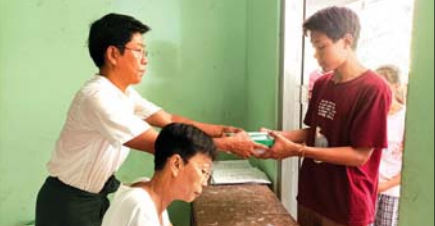
ပဲခူးတိုင်းဒေသကြီး ပေါက်ခေါင်းမြို့နယ်၌ ကျောင်းအပ်နေသည့် ကျောင်းသားတစ်ဦးအား စာအုပ်များ ထုတ်ပေးနေစဉ်။ (ပေါက်ခေါင်းမြို့နယ်၌ အခြေခံပညာကျောင်းပေါင်း ၂၀၉ ကျောင်းဖွင့်လှစ်သဖြင့် မည်သည့်ကျောင်းသို့ သိရသည်။) သန်းထွန်းအောင်(ပြန်/ဆက်)