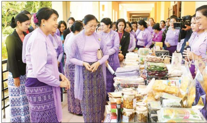
မြန်မာနိုင်ငံ မိခင်နှင့် ကလေးစောင့်ရှောက်ရေးအသင်း ဂုဏ်ထူးဆောင်နာယက နိုင်ငံတော်စီမံအုပ်ချုပ်ရေးကောင်စီဥက္ကဋ္ဌ နိုင်ငံတော်ဝန်ကြီးချုပ်၏ဇနီး ဒေါ်ကြူကြူလှနှင့် အဖွဲ့ဝင်များ ဒေသထွက်ကုန်ပစ္စည်းများနှင့် ရိုးရာလက်မှုပစ္စည်းများ ခင်းကျင်းပြသရောင်းချနေမှုကို လှည့်လည်ကြည့်ရှုအားပေးစဉ်။

လည်းကောင်း၊ အသင်းဘဏ္ဍာရေး မှုးက ၂၀၂၂ - ၂၀၂၃ ခုနှစ် စေ့စရာရင်းရှင်းတမ်းနှင့် ၂၀၂၃ - ၂၀၂၄ ရလဒ်မှန်းခြေစာရင်းကို လည်းကောင်း ဖတ်ကြားတင်သွင်းကြသည်။ ဆွေးနွေးအတည်ပြု ယင်းနောက် နေပြည်တော်၊ တိုင်းဒေသကြီးနှင့် ပြည်နယ် မိခင်နှင့် ကလေး စောင့်ရှောက်မှုကြီးကြပ်ရေးအဖွဲ့များက ၂၀၂၃ ခုနှစ် နှစ်ချုပ်အစီရင်ခံစာကို ဖတ်ကြားတင်သွင်းကြပြီး တက်ရောက်လာကြသူများက အစည်းအဝေး ဆုံးဖြတ်ချက်များနှင့် ရှေ့လုပ်ငန်းစဉ်များ ချမှတ်နိုင်ရန် ဆွေးနွေးအတည်ပြုခဲ့ကြကြောင်း သတင်းရရှိသည်။ သတင်းစဉ်