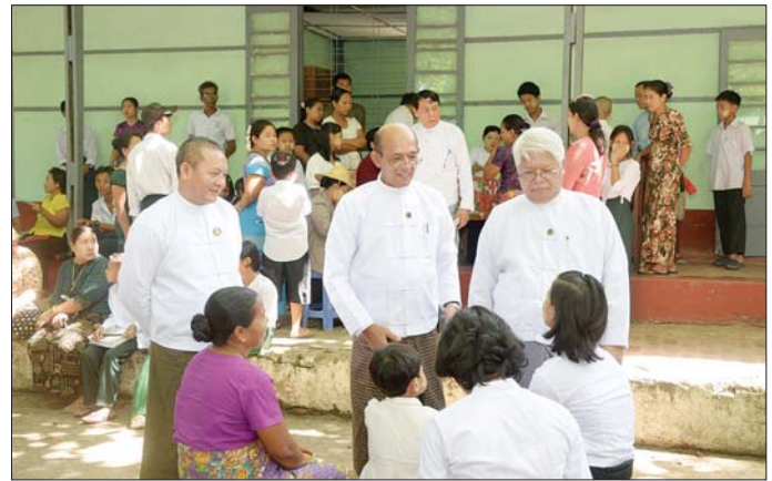
တွင် ကျောင်းအပ်နှံရေး လက်ခံဆောင်ရွက်သွားမည် ဖြစ်ပြီး ကျောင်းအပ်နှံသည့် ကလေးများ

များ ဖြစ်ထွန်းရေးအတွက် လေ့ကျင့်ပျိုးထောင်ပေးလျက်ရှိကြောင်း၊ ကျောင်းနေအရွယ်ကလေးများအားလုံးကျောင်းအပ်နှံရေးအတွက် သက်ဆိုင်ရာ မိဘအုပ်ထိန်းသူများ၊ ရပ်ရွာလူထုများ၊ ဌာနဆိုင်ရာများအနေဖြင့် အမျိုးသားရေးတာဝန် တစ်ရပ်အဖြစ် ပူးပေါင်းပါဝင် ဆောင်ရွက်သွားကြရန် တိုက်တွန်းပါကြောင်း မှာကြားကာ ကျောင်းသား ကျောင်းသူများကို ရင်းရင်းနှီးနှီးနှုတ်ဆက်၍ လိုအပ်သည်များ ဖြည့်ဆည်းဆောင်ရွက်ပေးသည်။ ပညာရေးဝန်ကြီးဌာနအနေဖြင့် ကျောင်းအပ်နှံရေးသီတင်းပတ်အဖြစ် မေ ၂၃ ရက်မှ ဇွန် ၂ ရက်အထိ နိုင်ငံတစ်ဝန်းရှိ အခြေခံပညာကျောင်းများ အသီးသီး