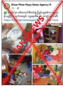
ယခုဖြစ်စဉ်မှာလည်း နယ်မြေလုံခြုံရေးဆောင်ရွက်လျက်ရှိသည့် လုံခြုံရေးပူးပေါင်းတပ်ဖွဲ့ဝင်များကို

တိုက်ခိုက်ခြင်း၊ ၎င်းတို့ကို ထောက်ခံအားပေးခြင်းမရှိသည့် ကျေးရွာများကို မီးရှို့ဖျက်ဆီးခြင်း၊ လက်နက်ကြီးများဖြင့် ပစ်ခတ်တိုက်ခိုက်ခြင်းများကို ရည်ရွယ်ချက်ရှိရှိ လုပ်ဆောင်လျက်ရှိသည့် အတွက် နေအိမ်များ မီးလောင်ပျက်စီးခဲ့ရသည်။ ထို့ကြောင့် လုံခြုံရေးတပ်ဖွဲ့ဝင်များက မီးလောင်ပျက်စီးခဲ့သည့် ကျေးရွာများမှ ဒေသခံတာဝန်ရှိသူများနှင့် အတူ ပြန်လည်ထူထောင်ရေးလုပ်ငန်းများ ပူးပေါင်းဆောင်ရွက်ပေးလျက်ရှိသည်။