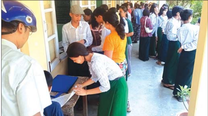
စစ်ကိုင်းမြို့ရှိ အခြေခံပညာကျောင်းတစ်ကျောင်းတွင် လာရောက်ကျောင်းအပ်ကြသည့် ကျောင်းသား ကျောင်းသူများ။ ဇော်မြင့်နိုင်