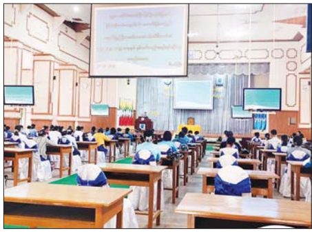
နိုင်ငံတစ်ဝန်းတက္ကသိုလ်(အထက်မြန်မာပြည်) ငွေစုငွေချေးသမဝါယမအသင်းလီမိတက်၏ အရပ်ရပ်ဆိုင်ရာအစည်းအဝေး ကျင်းပစဉ်။