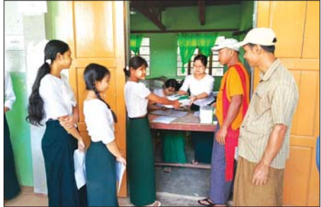
မင်းလှမြို့နယ်မှ ကျောင်းတစ်ကျောင်း၌ ကျောင်းသား ကျောင်းသူများ ကျောင်းအပ်နေစဉ်။ (မင်းလှမြို့နယ်အတွင်း အခြေခံပညာကျောင်း ၁၅၄ ကျောင်း၊ ဘုန်းတော်ကြီးသင်ပညာရေး ငါးကျောင်းတို့၌ ကျောင်းအပ်လက်ခံလျက်ရှိသည်။) ပေါက်စ(မင်းလှ)