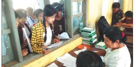
ပဲခူးတိုင်းဒေသကြီး ဇီးကုန်းမြို့နယ်မှ ကျောင်းတစ်ကျောင်း၌ ကျောင်းအပ်လက်ခံနေစဉ်။ (ဇီးကုန်းမြို့နယ်အတွင်း အခြေခံပညာကျောင်း ၁၀၄ ကျောင်းနှင့် ကိုယ်ပိုင်ကျောင်းလေးကျောင်းတို့၌ ကျောင်းအပ်လက်ခံလျက်ရှိသည်။) တင့်ဆွေ(ပြန်/ဆက်)