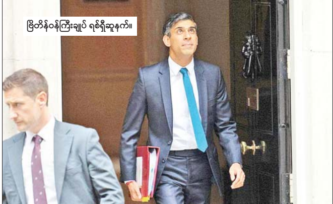
ဗြိတိန်ဝန်ကြီးချုပ် ရစ်ရှီဆူနက်။ ဗြိတိန်ဝန်ကြီးချုပ် အဓိကလိုအပ် အခွင့်အရေးဖြစ်ကြောင်း အတိုက်အခံလောဘာပါတီမှ သည့် အချိန်ကာလဖြစ်ကြောင်းနှင့် ယခု ခေါင်းဆောင်ကိစ္စရာစတာမားက ပြောသည်။ ရွေးကောက်ပွဲသည် အပြောင်းအလဲပြုလုပ်ရန် အင်န်အိတ်ချ်ကေ

ယူဆခဲ့ကြသည်။ ဘောရစ်ဂျွန်ဆင်၏ အုပ်ချုပ်မှုအောက်တွင် ကိုဗစ်-၁၉ ကူးစက်မှုကာလ ပိတ်ဆို့မှုများနှင့် ပါတီအတွင်း အရှုပ်တော်ပုံများ ဆက်တိုက်ကြုံတွေ့ခဲ့ရသည်။ လစ်ထရပ်စ်အစိုးရသည် စီးပွားရေးမငြိမ်မသက်ဖြစ်မှုများကြောင့် ဝေဖန်မှုများနှင့်ကြုံတွေ့ခဲ့ရသည်။ ဆူနက်သည် ၂၀၂၂ ခုနှစ်တွင် ဝန်ကြီးချုပ်အဖြစ် စတင်တာဝန်ထမ်းဆောင်ခဲ့ပြီး ၎င်းသည် ငွေကြေးဖောင်းပွမှုလျော့နည်းရန်နှင့် လူဝင်မှုကြီးကြပ်ရေးကိစ္စရပ်များကို ကိုင်တွယ်ကာ ပြည်သူများ၏ယုံကြည်မှုရရှိအောင် ဆောင်ရွက်ခဲ့သည်။ ယခုလအတွင်း ကောက်ယူထားသည့် စစ်တမ်းများအရ ကွန်ဆာဗေးတစ်ပါတီသည် အတိုက်အခံလောဘာပါတီနှင့်နှိုင်းယှဉ်လျှင် လူထုကြိုက်နှစ်သက်မှုတွင် ၂၀ ရာခိုင်နှုန်း နောက်ကျကျန်ခဲ့သည်ဟု တွေ့ရှိရသည်။ နောက်ဆုံးတွင် အထွေထွေရွေးကောက်ပွဲကျင်းပမည့်နေ့ကို ဝန်ကြီးချုပ်က ကြေညာလိုက်ပြီ