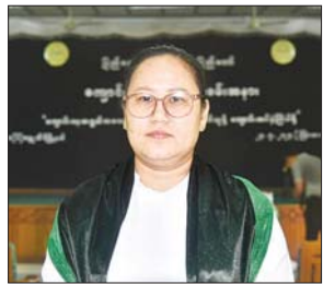
ဒေါ်ယမင်းသူ