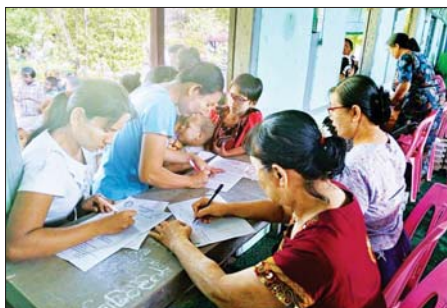
မကွေးတိုင်းဒေသကြီး ပခုက္ကူမြို့နယ်၌ ၂၀၂၄-၂၀၂၅ ပညာသင်နှစ်အတွက် ကျောင်းသား ကျောင်းသူများအား ကျောင်းအပ်လက်ခံနေမှုကို တွေ့ရစဉ်။