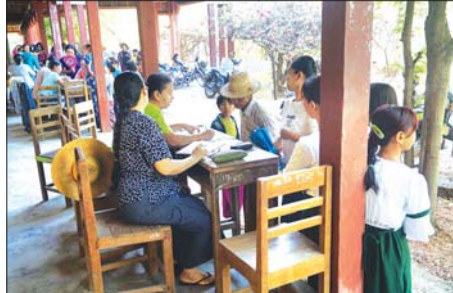
မန္တလေးတိုင်းဒေသကြီး ငါးစွန်းမြို့နယ်မှ ကျောင်းတစ်ကျောင်း၌ ကျောင်းအပ်လက်ခံနေစဉ်။ (ငါးစွန်းမြို့နယ်အတွင်း ယခုပညာသင်နှစ်တွင် အခြေခံပညာကျောင်း ၁၂၇ ကျောင်း ဖွင့်လှစ်မည်ဖြစ်ကြောင်း သိရသည်။) ကျော်ဆန်းမြင့်