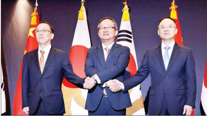
သဘာဝဘေးဒဏ် ကြုံတွေ့ချိန်တွင် ပူးပေါင်းဆောင်ရွက်ရေးများ ပါဝင်မည်ဖြစ်ကြောင်း သမ္မတရုံးက ဆက်လက်ထုတ်ပြန်ထားသည်။ ဒေသတွင်း ပူးပေါင်းဆောင်ရွက်မှုဖြင့် တင်ရန် ၂၀၀၈ ခုနှစ်မှ စကာ အာရှသုံးနိုင်ငံ နှစ်စဉ် ဆွေးနွေးပွဲ ကျင်းပသွားရန် သဘောတူခဲ့ကြသည်။ ဆွေးနွေးပွဲအပြီးတွင် ပူးတွဲကြေညာချက် ထုတ်ပြန်သွားမည်ဖြစ်သည်။ သို့သော်လည်း ပဏာမ ဆွေးနွေးပွဲများကို ကိုဗစ်-၁၉ ကူးစက်ရောဂါနှင့် ဂျပန်နှင့် ကိုရီးယားတို့၏ အငြင်းပွားမှုကြောင့် မကျင်းပနိုင်ဘဲ နှောင့်နှေးခဲ့ရသည်။ နောက်ဆုံးသုံးပွင့်ဆိုင် ဆွေးနွေးပွဲကို ၂၀၁၄ ခုနှစ် ဒီဇင်ဘာလတွင် ကျင်းပခဲ့သည်။ ယခုဆွေးနွေးပွဲသည် သုံးပွင့်ဆိုင် ပူးပေါင်းဆောင်ရွက်မှုကို ပုံမှန်အတိုင်းပြန်လည်ဖြစ်စေမည့် အလှည့်အပြောင်း အချိုးအကွေ့ တစ်ခုဖြစ်မည်ဖြစ်ကြောင်း သမ္မတရုံးက ဆက်လက်ဖော်ပြခဲ့သည်။ အင်န်အိတ်ချ်ကေ

ဆိုးလ် မေ ၂၃ တောင်ကိုရီးယား၊ တရုတ်နှင့် ဂျပန် ခေါင်းဆောင်များသည် လာမည့်တနင်္လာနေ့တွင် တောင်ကိုရီးယားနိုင်ငံ ဆိုးလ်မြို့၌ သုံးပွင့်ဆိုင်ဆွေးနွေးပွဲ ကျင်းပမည် ဖြစ်သည်။ ထိုသို့ ကျင်းပခြင်းသည် လေးနှစ်ခွဲကာလအတွင်း ပထမဆုံး ဖြစ်သည်။ တောင်ကိုရီးယား သမ္မတ ယွန်ဆွန်ယေဝ်သည် တရုတ် ဝန်ကြီးချုပ်လီကျန်နှင့် ဂျပန် ဝန်ကြီးချုပ် ကိုရိုဒါးဖူမိယိုတို့နှင့် လာမည့် တနင်္ဂနွေနေ့တွင် တွေ့ဆုံဆွေးနွေးသွားမည် ဖြစ်ကြောင်း တောင်ကိုရီးယားသမ္မတရုံးက မေ ၂၃ ရက်တွင် ပြောကြားလိုက်သည်။ ဆွေးနွေးသွားမည့် အကြောင်းအရာများတွင် စီးပွားရေး၊ အသိအမြင်များ ပိုမိုကျယ်ပြန့်ရန် ပြည်သူ့အချင်းချင်း ဖလှယ်ရေး၊ ဒစ်ဂျစ်တယ် နည်းပညာနှင့်