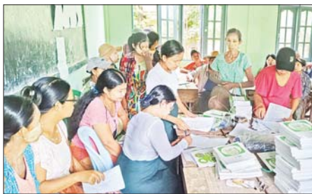
ကန်ကြီးထောင့်မြို့နယ်၌ ၂၀၂၄-၂၀၂၅ ပညာသင်နှစ် ကျောင်းသား ကျောင်းသူများအား ကျောင်းအပ်လက်ခံနေမှုကို တွေ့ရစဉ်။ မြို့နယ် (ပြန်/ဆက်)