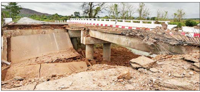
ရန်ကုန်-မော်လမြိုင် ပြည်ထောင်စုကားလမ်းမပေါ်ရှိ မစောတံတားအား KNLA အဖွဲ့မှ အကြမ်းဖက်မှုကို လိုလားသူများနှင့် PDF အကြမ်းဖက်ပူးပေါင်းအဖွဲ့မှ မိုင်းထောင်ဖောက်ခွဲမှုကြောင့် တံတားပျက်စီးမှု မှတ်တမ်းဓာတ်ပုံ။

သွား ပြည်ထောင်စုလမ်းမ ပေါ်ရှိ မိုင်းထိုင်အမှတ် ၁၂၉/၁ နှင့် ၁၂၉/၂ ကြား၊ တံတားအမှတ် (၁/၁၃၀)၊ အရှည် ၁၀၆ ပေ၊ အကျယ် ၂၄ ပေ၊ ခံနိုင်ရည်ရှိသော ကုန်ကျစရိတ် အမျိုးအစား မစောတံတားကို ယနေ့နံနက် ၅ နာရီခန့်တွင် KNLA အဖွဲ့မှ အကြမ်းဖက်မှု လိုလားသူများနှင့် PDF အမည်ခံ အကြမ်းဖက်ပူးပေါင်းအဖွဲ့များက မိုင်းထောင်ဖောက်ခွဲ ဖျက်ဆီးခဲ့သဖြင့် တံတားပြိုကျ ပျက်စီးမှု