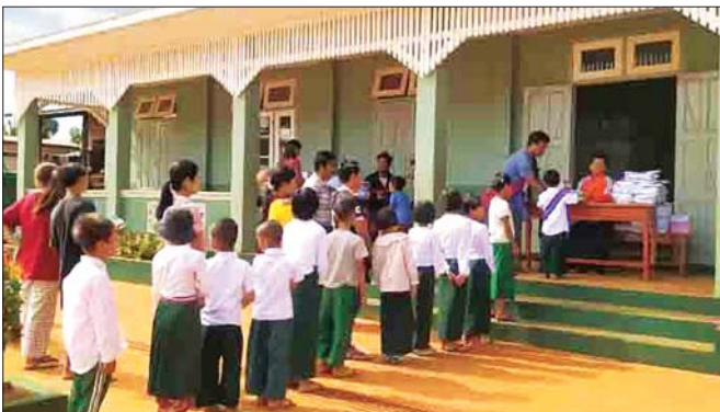
ပအိုဝ်းကိုယ်ပိုင်အုပ်ချုပ်ခွင့်ရဒေသ ဆီဆိုင်မြို့နယ်၌ ၂၀၂၄-၂၀၂၅ ပညာသင်နှစ် ကျောင်းသား ကျောင်းသူများအား ကျောင်းအပ်လက်ခံနေမှုကို တွေ့ရစဉ်။