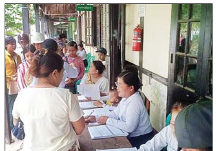
အိမ်မဲမြို့နယ်၌ ၂၀၂၄-၂၀၂၅ ပညာသင်နှစ် ကျောင်းသား ကျောင်းသူများအား ကျောင်းအပ်လက်ခံနေမှုကို တွေ့ရစဉ်။