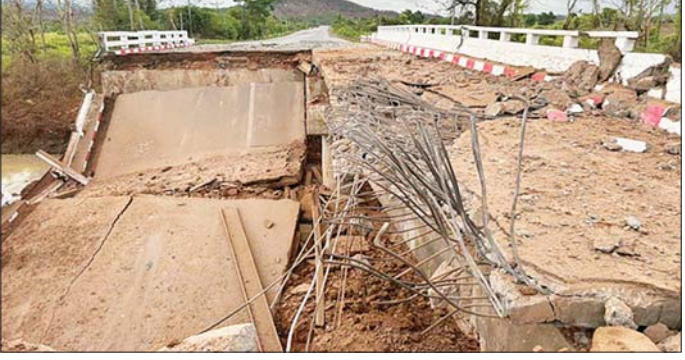
ရန်ကုန်-မော်လမြိုင် ပြည်ထောင်စုကားလမ်းမပေါ်ရှိ မစောတံတားအား KNLA အဖွဲ့မှ အကြမ်းဖက်မှုကို လိုလားသူများနှင့် PDF အကြမ်းဖက်ပူးပေါင်းအဖွဲ့မှ မိုင်းထောင်ဖောက်ခွဲမှုကြောင့် တံတားပျက်စီးမှု မှတ်တမ်းဓာတ်ပုံ။

ဖြစ်ပွားခဲ့သည်။ ထိုသို့ တံတားကို မိုင်းထောင်ဖောက်ခွဲမှုကြောင့် တံတားပေါ်တွင် ဖြတ်သန်းမောင်းနှင်နေသည့် မော်တော်ဆိုင်ကယ် သုံးစီး တံတားအောက် သို့ပြုတ်ကျခဲ့ပြီး ခရီးသွားပြည်သူ တစ်ဦး သေဆုံး၍ နှစ်ဦးထိခိုက် ဒဏ်ရာရရှိခဲ့ကြောင်းနှင့် ဒဏ်ရာရရှိသူ နှစ်ဦးအား ဘီးလင်းမြို့ ပြည်သူ့ဆေးရုံသို့ ပို့ဆောင်ဆေးကုသမှု ခံယူစေလျက်ရှိကြောင်း သိရှိရသည်။ အကြမ်းဖက်သမားများ အနေဖြင့် အများပြည်သူသွားလာမှု