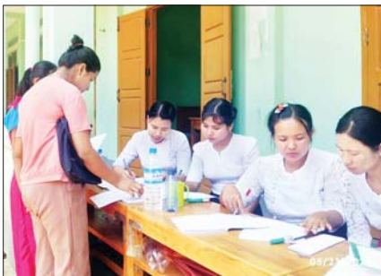
ကချင်ပြည်နယ် ရွှေကျီမြို့၌ ၂၀၂၄-၂၀၂၅ ပညာသင်နှစ် ကျောင်းသား ကျောင်းသူများအား ကျောင်းအပ်လက်ခံနေမှုကို တွေ့ရစဉ်။ မြို့နယ် (ပြန်/ဆက်)