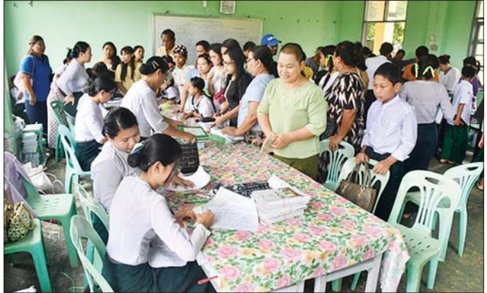
ဆောင်ရွက်ပေးလျက်ရှိသည်။ ယင်းသို့ အခြေခံပညာကျောင်းများတွင် ကျောင်း အပ်နှံနေမှုများကို နေပြည်တော်ကောင်စီဥက္ကဋ္ဌ၊ တိုင်းဒေသကြီးနှင့် ပြည်နယ်အသီးသီးမှ ဝန်ကြီးချုပ် များ၊ တိုင်းစစ်ဌာနချုပ်အသီးသီးမှ တိုင်းမှူးများနှင့် တာဝန်ရှိသူများ၊ ပညာရေးဝန်ကြီးဌာနမှ တာဝန်ရှိသူ များနှင့် ဌာနဆိုင်ရာတာဝန်ရှိသူများက သွားရောက် ကြည့်ရှုအားပေးကြပြီး လိုအပ်သည်များ ပါဝင်စပ် ညှိနှိုင်းဆောင်ရွက်ပေးခဲ့ကြောင်း သတင်းရရှိသည်။ သတင်းစဉ်

ကျောင်းသား ကျောင်းသူများ အဆင်ပြေချောမွေ့စွာ ကျောင်းအပ်နှံနိုင်ရေးဆောင်ရွက်ပေးကြပြီး ကျောင်း သား ကျောင်းသူများအတွက် ပညာရေးဝန်ကြီးဌာနမှ အခမဲ့ထောက်ပံ့ပေးအပ်သည့် စာရေးကိရိယာများ နှင့် ကျောင်းသုံးစာအုပ်များကိုလည်း တစ်ပါတည်း ထောက်ပံ့ပေးအပ်ကြသည်။ ကျောင်းအပ်နှံရေးသီတင်းပတ်၏ ပထမဆုံးရက် ဖြစ်သည့် ယနေ့တွင် တိုင်းဒေသကြီးနှင့် ပြည်နယ် အသီးသီးရှိ အခြေခံပညာကျောင်းများ၊ ကိုယ်ပိုင် ကျောင်းများနှင့် ဘုန်းတော်ကြီးသင်ပညာရေးကျောင်း များ၌ ကျောင်းအပ်နှံသူ ၁၇၉၂၈၀၈ ဦးရှိပြီး ကျောင်း များ၏လုံခြုံရေးနှင့် ကျောင်းအပ်နှံမှု လက်ခံဆောင် ရွက်သည့် ဆရာ ဆရာမများ၊ လာရောက်ကျောင်း အပ်နှံကြသည့် ကျောင်းသား ကျောင်းသူများနှင့် မိဘများ၏ လုံခြုံရေးအတွက် သက်ဆိုင်ရာလုံခြုံရေး တာဝန်ရှိသူများနှင့်တာဝန်သိပြည်သူများက ပူးပေါင်း