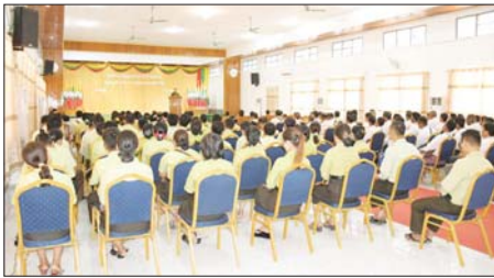
အသက်အရွယ်၊ ပြည်သူ့စစ်မှုထမ်းရန်ကာလ၊ ပြည်သူ့စစ်မှုထမ်းတို့၏ အကျိုးခံစားခွင့်များ၊ ပြည်သူ့စစ်မှု

တောင်ငူ မတ် ၉ ပဲခူးတိုင်းဒေသကြီး ပြည်သူ့စစ်မှုထမ်းဆောင်ရေးအဖွဲ့မှ ပြည်သူ့စစ်မှုထမ်းဥပဒေ၊ နည်းဥပဒေများ ရှင်းလင်းဆွေးနွေးပွဲကို မတ် ၇ ရက်က တောင်ငူမြို့၊ ခပေါင်းခန်းမ၌ ကျင်းပသည်။ အခမ်းအနားတွင် တိုင်းဒေသကြီး လုံခြုံရေးနှင့် နယ်စပ်ရေးရာဝန်ကြီး ဗိုလ်မှူးကြီး အောင်သောင်းထိုက်က ပြည်သူ့စစ်မှုထမ်း ဥပဒေ ရည်ရွယ်ချက်၊ စစ်မှုထမ်းရမည့်