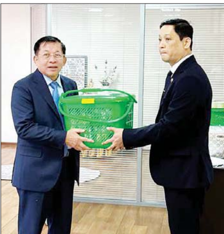
နိုင်ငံတော်စီမံအုပ်ချုပ်ရေးကောင်စီဥက္ကဋ္ဌ နိုင်ငံတော်ဝန်ကြီးချုပ် ဗိုလ်ချုပ်မှူးကြီး မင်းအောင်လှိုင် ကောင်စစ်ဝန်ချုပ်ရုံး မိသားစုများ နှင့် သင်တန်းသားအရာရှိများအတွက် စားသောက်ဖွယ်ရာများ ပေးအပ်စဉ်။

များအား ရင်းရင်းနှီးနှီး နှုတ်ဆက် ခဲ့ကြောင်း သတင်းရရှိသည်။ သတင်းစဉ်