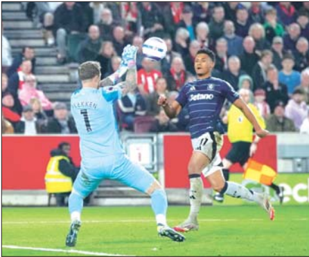
အက်စ်တွန်ပီလာကစားသမား ဝတ်ကင်စ် ဝိုးသွင်းယူရန် ကြိုးပမ်းစဉ်။

အက်စ်တွန်ပီလာက ဘရန်ဖို့ဒ်ကို အနိုင်ယူပြီး လာမည့်နှစ် ချန်ပီယံလိဂ် ဝင်ခွင့်မျှော်လင့်ချက် အားကောင်းလာ ပရီမီယာလိဂ် ပွဲစဉ် (၂၈) မှ မတ် ၉ ရက် နံနက်အစောပိုင်းက ယှဉ်ပြိုင်ကစားခဲ့သည့် ဘရန်ဖို့ဒ်နှင့် အက်စ်တွန်ပီလာအသင်းပွဲစဉ်တွင် အက်စ်တွန်ပီလာအသင်းက ပွဲကစားချိန် ၄၉ မိနစ်တွင် ရရှိခဲ့သော တိုက်စစ်ကစားသမား ဝတ်ကင်စ်၏ တစ်လုံးတည်းသော သွင်းဂိုးဖြင့် အနိုင်ရရှိခဲ့သည်။ စာမျက်နှာ ၂၁ ကော်လံ ၁