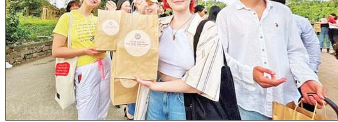
အဆိုပါ ကာလအတွင်း ဗီယက်နမ်နိုင်ငံသို့ လေကြောင်းမှ တစ်ဆင့် နိုင်ငံတကာခရီးသွား ဝင်ရောက်မှုမှာ ၃ ဒဿ ၄ သန်း ခန့်ရှိကြောင်း၊ ယင်းမှာ နိုင်ငံတကာ ခရီးသွားဝင်ရောက်မှု စုစုပေါင်း၏ ၈၅ ဒဿ ၇ ရာခိုင်နှုန်းရှိကြောင်း၊ ကုန်းလမ်းမှတစ်ဆင့် ၄၆၅၂၀၀ (၁၁ ဒဿ ၈ ရာခိုင်နှုန်း) နှင့်