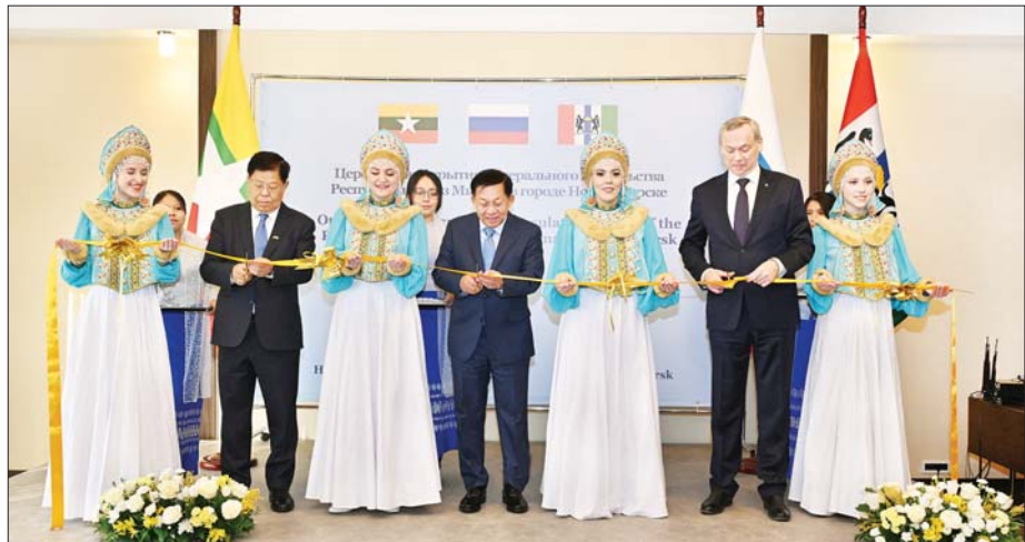
နိုင်ငံတော်စီမံအုပ်ချုပ်ရေးကောင်စီဥက္ကဋ္ဌ နိုင်ငံတော်ဝန်ကြီးချုပ် ပိုလ်ချုပ်မှူးကြီး မင်းအောင်လှိုင်၊ ဒုတိယဝန်ကြီးချုပ်နှင့် နိုင်ငံခြားရေးဝန်ကြီးဌာန ပြည်ထောင်စုဝန်ကြီး ဦးသန်းဆွေနှင့် နိဗ္ဗိတိဗိမ္ဗိဒေသ အုပ်ချုပ်ရေးမှူး၊ မစ္စတာ တရုဗနီကော့ဘ်အန်ဒရေ အလက်ဇန်ဒရိုဘစ်ချ်တို့ ကောင်စစ်ဝန်ချုပ်ရုံးအား ဖဲကြိုးဖြတ်ဖွင့်လှစ်ပေးစဉ်။

ချုပ်နှင့် ကောင်စစ်ဝန်ချုပ်ရုံးမှ တာဝန်ရှိသူများ၊ မြန်မာနိုင်ငံမှ နိဗ္ဗိတိဗိမ္ဗိမြို့တွင် သွားရောက်ပညာသင်ကြားလျက်ရှိသည့် သင်တန်းသားအရာရှိများနှင့် ဖိတ်ကြားထားသည့် စည်ညည်တော်များ တက်ရောက်ကြသည်။ ဦးစွာ ပြည်ထောင်စုသမ္မတမြန်မာနိုင်ငံတော် နိုင်ငံတော်သိချင်းနှင့် ရုရှားဖက်ဒရေးရှင်းနိုင်ငံ နိုင်ငံတော်သိချင်းတို့အား ဖွင့်လှစ်၍ အလေးပြုကြသည်။ ယင်းနောက် ဒုတိယဝန်ကြီးချုပ်နှင့် နိုင်ငံခြားရေးဝန်ကြီးဌာန ပြည်ထောင်စုဝန်ကြီး ဦးသန်းဆွေက အဖွင့်နှုတ်ခွန်းဆက်စကား ပြောကြားရာတွင် မြန်မာ-ရုရှားနှစ်နိုင်ငံသည် သံတမန်ဆက်ဆံရေး (၇၇) နှစ်ကြာ ရှိခဲ့ပြီဖြစ်ပြီး ယခုကဲ့သို့ နိဗ္ဗိတိဗိမ္ဗိမြို့တွင် မြန်မာကောင်စစ်ဝန်ချုပ်ရုံးကို ဖွင့်လှစ်