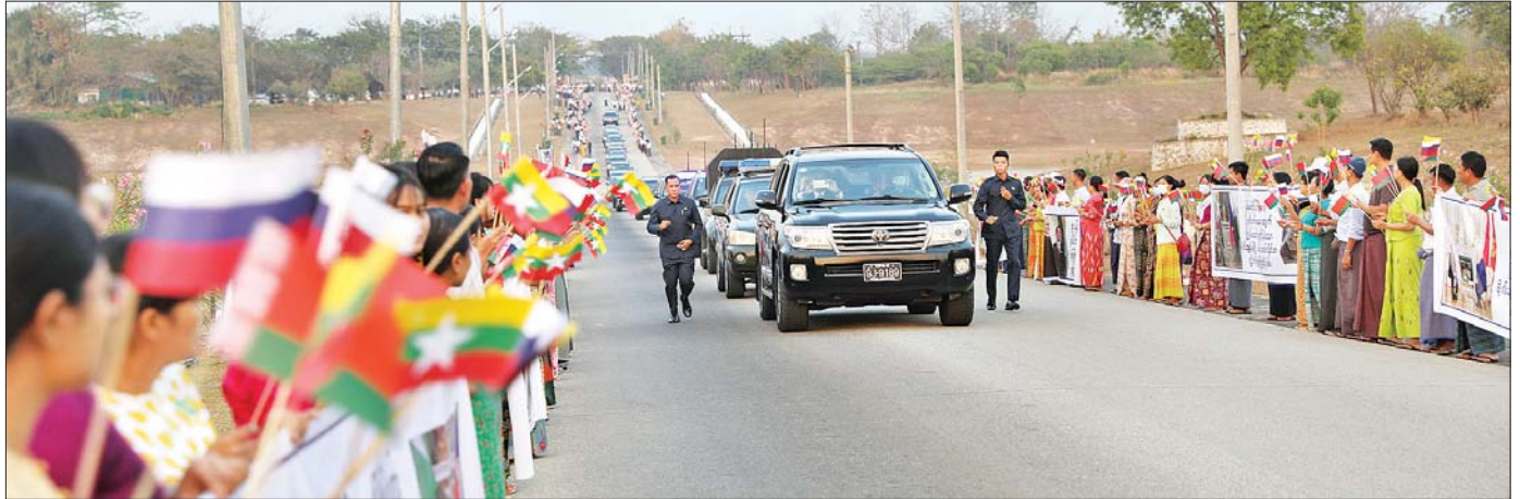
နိုင်ငံတော်စီမံအုပ်ချုပ်ရေးကောင်စီဥက္ကဋ္ဌ နိုင်ငံတော်ဝန်ကြီးချုပ် ဗိုလ်ချုပ်မှူးကြီး မင်းအောင်လှိုင် ဦးဆောင်သည့် မြန်မာအဆင့်မြင့်ကိုယ်စားလှယ်အဖွဲ့အား ပြည်သူများက သောင်းသောင်းမြေဖြူ ကြိုဆိုစဉ်။