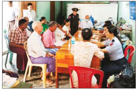
မင်္ဂလာတောင်ညွန့်မြို့နယ်၌ အိမ်ထောင်စုစာရင်းနှင့် နိုင်ငံသားစိစစ်ရေးကတ်များ ကွင်းဆင်းဆောင်ရွက်

စိတ် ရှင်းလင်းပြောကြားသည်။ ထို့နောက် တိုင်းဒေသကြီး လုံခြုံရေးနှင့် နယ်စပ်ရေးရာဝန်ကြီးက တောင်ငူမြို့နယ် ပြည်သူ့စစ်မှုထမ်းနှင့် အကြမ်းဖက်နှိမ်နင်းရေးအဖွဲ့ (မြို့ပြ) အဖွဲ့ဝင်များအား မြို့နယ် အထွေထွေအုပ်ချုပ်ရေးဦးစီးဌာန နတ်သျှင်ဇော် အစည်းအဝေးခန်းမ၌ တွေ့ဆုံပြီး စားသောက်ဖွယ်ရာများ ချီးမြှင့်ပေးအပ်ခဲ့ကြောင်း သိရသည်။ ခရိုင်(ပြန်/ဆက်)