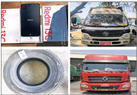
မန္တလေးတိုင်းဒေသကြီး၌ ဖမ်းဆီးရမိမှု။ ကိုလည်းကောင်း စုစုပေါင်း ခန့်မှန်းတန်ဖိုးငွေကျပ် ၁၇၀၂၃၄၀၀၀ ကို ဖမ်းဆီးရမိခဲ့ပြီး အကောက်ခွန်လုပ်ထုံးလုပ်နည်းများနှင့်အညီ အရေးယူဆောင်ရွက်လျက်ရှိသည်။ ယင်းအပြင် မတ် ၈ ရက်တွင် ရှမ်းပြည်နယ် တရားမဝင် ကုန်သွယ်မှု တိုက်ဖျက်ရေးအဖွဲ့အဖွဲ့၏ စီမံခန့်ခွဲမှုဖြင့် တာဝန်ကျပူးပေါင်းအဖွဲ့က စစ်ဆေးမှုများ ဆောင်ရွက်ခဲ့ရာ မူဆယ်မြို့၊ ပန်ခန်းတံတားအနီး၌ မော်တော်ယာဉ်စီးပေါ်မှ တရားဝင်စာချုပ်စာတမ်းအထောက်အထား တင်ပြနိုင်ခြင်းမရှိသည့် လုပ်ငန်းသုံးပစ္စည်းနှစ်မျိုး (ခန့်မှန်းတန်ဖိုးငွေကျပ် ၇၀၀၀၀၀)နှင့် အဆိုပါပစ္စည်းများ တင်ဆောင်လာသည့် Nissan Caravan တစ်စီး (ခန့်မှန်းတန်ဖိုးငွေကျပ် ၂၀၀၀၀၀၀) စုစုပေါင်း ခန့်မှန်းတန်ဖိုးငွေကျပ် ၂၇၀၇၀၀၀ ကို ဖမ်းဆီးရမိခဲ့ပြီး အကောက်ခွန်လုပ်ထုံးလုပ်နည်းများနှင့်အညီ အရေးယူဆောင်ရွက်လျက်ရှိသည်။ ၂၀၂၅ ခုနှစ် မတ် ၆ ရက်၊ ၇ ရက်၊ ၈ ရက်တို့တွင် ဖမ်းဆီးရမိမှု စုစုပေါင်းမှာ အမှတ် ၂၄ မှ၊ ခန့်မှန်းတန်ဖိုးငွေကျပ် ၃၃၄၅၄၄၄၂၂ ကို ဖမ်းဆီးရမိခဲ့သည်။ ထိုသို့ တရားမဝင်တင်သွင်းလာမှုများကြောင့် တရားဝင်တင်သွင်းသည့် ကုန်သည်လုပ်ငန်းရှင်များအတွက် ဈေးကွက် ယှဉ်ပြိုင်နိုင်မှုစွမ်းအားကျဆင်းခြင်းနှင့် ထိခိုက်နစ်နာမှုများ ဖြစ်ပေါ်နိုင် စေပြီး နိုင်ငံတော်အတွက် ရသင့်ရထိုက်သည့် အခွန်လာအွှားဆုံးရှုံးနစ်နာခြင်းများ ဖြစ်ပေါ်စေနိုင်ပါသည်။ သို့ဖြစ်၍ တရားမဝင် ကုန်သည် တင်သွင်းမှုများအား သက်ဆိုင်ရာတာဝန်ရှိသူများက ယခုထက်ပိုမို တားဆီးစစ်ဆေးကြပ်ဖမ်းဆောင်ရွက်သွားမည်ဖြစ်ကြောင်း တရားမဝင် ကုန်သွယ်မှုတိုက်ဖျက်ရေးဦးဆောင်ကော်မတီမှ သိရသည်။ သတင်းစဉ်