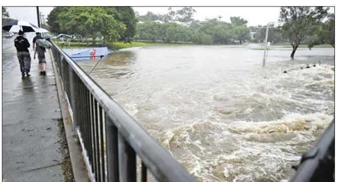
ဆိုင်ကလုန်းအဲလ်ဖရက်ဒ်ကြောင့် နယူးဆောက် မတ် ၈ ရက်တွင် ဩစတြေးလျကွယ်ရေး ဝေးလ်ပြည်နယ်မြောက်ပိုင်းတွင် မတ် ၇ ရက်မွန်းလွဲ တပ်ပွဲပွဲ ယာဉ်နှစ်စီးမတော်တဆဖြစ်ပွားခဲ့ကာ ပိုင်းက အမျိုးသားတစ်ဦး ရေထဲမျောပါခဲ့ကြောင်း ၁၃ ဦး ဒဏ်ရာရခဲ့သည်။ ဆင်ဟွာ

တစ်လျှောက် နောက်ထပ်အဓိက ရေကြီးမှု သတိပေးချက်နှင့် အချို့နေရာများတွင် လေပြင်း သတိပေးချက်နှင့် ပြင်းထန်သော မိုးကြိုးမုန်တိုင်း သတိပေးချက်တို့ကို ထုတ်ပြန်ခဲ့သည်။ နယူးဆောက်ဝေးလ်ပြည်နယ်တွင်အစိုးရကျောင်း ၂၅၄ ကျောင်းကို မတ် ၁၀ ရက်အထိ ပိတ်ထားရန် စီစဉ်ထားသည်။ ကွင်းစလန်းပြည်နယ်တွင်လည်း အစိုးရကျောင်းပေါင်း ၄၄၄ ကျောင်း၊ ပုဂ္ဂလိက ကျောင်း ၁၇၀နှင့် ကက်သလစ်ကျောင်း ၈၉ကျောင်း တို့ကို ပိတ်ထားကြောင်း ကြေညာထားသည်။ ထို့အတူ ကွင်းစလန်းပြည်နယ်တွင် အိမ်ခြေ ၂၃၇၀၀ နှင့် စီးပွားရေးလုပ်ငန်းများတွင် လျှပ်စစ်ဓါတ် ပြတ်တောက်နေဆဲဖြစ်ကာ နယူးဆောက်ဝေးလ် ပြည်နယ်မြောက်ပိုင်းရှိ အိမ်ခြေ ၁၂၅၀၀ သည် မတ် ၉ ရက် မွန်းလွဲပိုင်းအထိ လျှပ်စစ်ဓါတ်ပြတ်တောက် ခဲ့သည်။