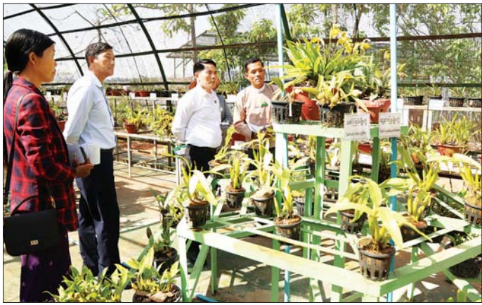
ပန်းမျိုးများ အရောင်ကွဲအလိုက် ရွေးချယ်စုဆောင်း ပြီး အသွင်သဏ္ဍာန်မျိုး ထူးခြားသည့်မျိုးသစ်များ သုတေသနပြုဖော်ထုတ်ရန်နှင့် ပြင်ဦးလွင် စတော်

အဝရရှိစေရေးအတွက် နေရောင်ခြည်စွမ်းအင်သုံး ဆိုလာပန်း ရေတင်စနစ်ကို အသုံးပြုဆောင်ရွက်ရန်နှင့် ဝန်ထမ်းများအားလုံး တစ်ပြေးညီတာဝန်ပေး၍ စနစ်တကျစီမံခန့်ခွဲပြီး ဖွဲ့စည်းအုပ်ချုပ်ရန် ဆွေးနွေး မှာကြားသည်။ ထိုမှတစ်ဆင့် ပြင်ဦးလွင်ရှိ စိုက်ပျိုးရေးဦးစီးဌာန ဥယျာဉ်ခြံဟင်းသီးဟင်းရွက်နှင့် အပင်စီစနည်းပညာ ဌာနခွဲက တာဝန်ယူဆောင်ရွက်လျက်ရှိသည့် ဦးကွင် ဥယျာဉ်ခြံကို ကြည့်ရှုစစ်ဆေးပြီး ပြင်ဦးလွင်မြို့ကို ပန်းမြို့တော်အဖြစ် စီမံဆောင်ရွက်နေမှုကို အထောက်အကူဖြစ်စေရန်အတွက် ထူးခြားဆန်းပြား သော ပန်းမျိုးများထုတ်လုပ်ဖြန့်ဖြူးခြင်း၊ မေမြို့ပန်း များအား မျိုးစပ်မျိုးမြှင့်စိုက်ပျိုးနည်းပညာပေးခြင်း လုပ်ငန်းများမြှင့်တင်ဆောင်ရွက်ရန်၊ ရေခြေဒေသနှင့် ကိုက်ညီသော ဟင်းသီးဟင်းရွက်နှင့် သစ်သီးဝလံ စိုက်ပျိုးနည်းပညာဖွံ့ဖြိုးတိုးတက်အောင် ဆောင်ရွက် ရန်၊ မျိုးရင်းတူဒေသသစ်မွေးမြူရေးကို မျိုးစပ်၍ ခေတ် နှင့်အညီ မျိုးသစ်များရှာဖွေဖော်ထုတ်ရန်၊ သစ်ခွ