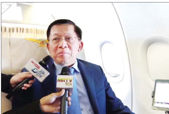
နိုင်ငံတော်စီမံအုပ်ချုပ်ရေးကောင်စီဥက္ကဋ္ဌ နိုင်ငံတော်ဝန်ကြီးချုပ် ဗိုလ်ချုပ်မှူးကြီး မင်းအောင်လှိုင် မီဒီယာများ၏ မေးမြန်းမှုများကို ပြန်လည်ဖြေကြားစဉ်။

ရွေးကောက်ပွဲလုပ်မယ့် အခြေအနေလည်း ကျွန်တော် ရှင်းပြတယ်။ ရှင်းပြတော့ သူတို့ ဒါကို လည်း အားပေးထောက်ခံတဲ့အတွက်ကြောင့် သူတို့ ဆီက ကိုယ်စားလှယ် လွှတ်ပြီးတော့ လာပြီးတော့ ရွေးကောက်ပွဲမှာ အကဲလာပြီး ကြည့်ပေးမယ့် အကြောင်းလည်း သူတို့ပြောတာရှိတယ်။ ပိုကောင်း တာကတော့ နှစ်ဦးနှစ်ဖက် ဒီတွေ့ဆုံခြင်းအားဖြင့် ယုံကြည်မှုတွေ အများကြီးရခဲ့တယ်ပဲ။ ရှေးနိုင်ငံ ရော ဘယ်လာရုစ်နိုင်ငံရော သူတို့နိုင်ငံမှာရှိတဲ့ ပြည်သူတွေကရော မြန်မာနိုင်ငံအပေါ်မှာ စိတ်ဝင် တစားနဲ့ တော်တော်ဖြစ်လာတာကို ကျွန်တော် တွေ့တယ်ပဲ။ ဒါဟာ ကျွန်တော်တို့အတွက် (နောက်အနာဂတ်နိုင်ငံအတွက်) (နောင်နိုင်ငံတော် အနာဂတ်အတွက်လည်း) ကောင်းတဲ့ လက္ခဏာ တစ်ခုပေါ့။ နောက်တစ်ခုကလည်း ပါတီစုံဒီမို ကရေစီ ရွေးကောက်ပွဲလုပ်မယ့်လို့ ကျွန်တော်ပြောခဲ့ တာရှိတယ်။ ဒါကို ကျွန်တော်တို့ နိုင်ငံမာလုပ်မှာ ပါ။ ပါတီစုံဒီမိုကရေစီစနစ်ကို တကယ်လိုချင်လို့ရှိရင် ကဏ္ဍကောစ လုပ်မနေနဲ့ ပူးပေါင်းဆောင်ရွက်ဖို့ပဲ လိုပါတယ်။ အဲဒါလုပ်မယ့် ဆိုလို့ရှိရင် ကျွန်တော်တို့ နိုင်ငံ မချအောင်မြင်ရမယ်ပဲ။ မချအောင်မြင်ရမယ် ကျွန်တော်ဒါကို ပြောရပါတယ်။ ပြည်သူတွေကို ကျွန်တော် ဒါလေးတော့ ကျွန်တော်ဘက်က သဘောထားပေါ့။ ကျွန်တော်ဒါကို ပြောပါရစေ။