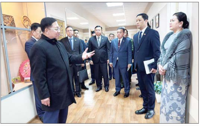
နိုင်ငံတော်စီမံအုပ်ချုပ်ရေးကောင်စီဥက္ကဋ္ဌ နိုင်ငံတော်ဝန်ကြီးချုပ် ဗိုလ်ချုပ်မှူးကြီး မင်းအောင်လှိုင် ကောင်စစ်ဝန်ချုပ်ရုံး မိသားစုများနှင့် သင်တန်းသားအရာရှိများအား ရင်းရင်းနှီးနှီး နှုတ်ဆက်စဉ်။

စာမျက်နှာ ၆ မှ ဆောင်ရွက်ပေးကြစေလိုမှု၊ နို့ဗို စီဗစ်မြို့ရှိ တက္ကသိုလ်များ၌ ပညာတော်သင်များ ပညာသင် ကြားနိုင်ရေးအတွက် ထပ်မံ စေလွှတ်ပေးသွားရန် စီစဉ် ဆောင် ရွက်လျက်ရှိမှုများနှင့် ကောင်စစ် ဝန်ချုပ်ရုံး ဝန်ထမ်းမိသားစုများနှင့် သင်တန်းသား အရာရှိများ၏ လိုအပ်ချက်များကို မေးမြန်းပြီး ဖြည့်ဆည်းဆောင်ရွက်ပေးသည်။ ယင်းနောက် နိုင်ငံတော်စီမံ အုပ်ချုပ်ရေးကောင်စီ ဥက္ကဋ္ဌ နိုင်ငံတော် ဝန်ကြီးချုပ်က ကောင်စစ်ဝန်ချုပ်ရုံး မိသားစုများ နှင့် သင်တန်းသားအရာရှိများ အတွက် စားသောက်ဖွယ်ရာများ နှင့် ချီးမြှင့်ငွေများ ပေးအပ် သည်။ ထို့နောက် နိုင်ငံတော်စီမံ အုပ်ချုပ်ရေးကောင်စီ ဥက္ကဋ္ဌ