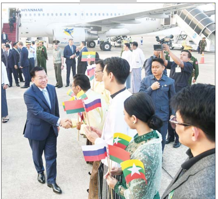
နိုင်ငံတော်စီမံအုပ်ချုပ်ရေးကောင်စီဥက္ကဋ္ဌ နိုင်ငံတော်ဝန်ကြီးချုပ် ဗိုလ်ချုပ်မှူးကြီး မင်းအောင်လှိုင်အား အနုပညာရှင်များက နေပြည်တော် တပ်မတော်လေဆိပ်၌ ကြိုဆိုနှုတ်ဆက်စဉ်။

အလားတူ မြန်မာအဆင့်မြင့် ချစ်ကြည်ရေးကိုယ်စားလှယ်အဖွဲ့သည် ဘယ်လာရုစ်နိုင်ငံသို့ နိုင်ငံတော်အဆင့် တရားဝင်ချစ်ကြည်ရေးခရီးသွားရောက်စဉ်တွင်လည်း နိုင်ငံတော်စီမံအုပ်ချုပ်ရေးကောင်စီဥက္ကဋ္ဌ နိုင်ငံတော်ဝန်ကြီးချုပ်သည် မတ် ၇ ရက်တွင် ဘယ်လာရုစ်သမ္မတနိုင်ငံ သမ္မတ H.E. Mr. Alexander Gregoryevich Lukashenko နှင့် တွေ့ဆုံဆွေးနွေးခြင်းအပါအဝင် အမျိုးသားလွှတ်တော်ဥက္ကဋ္ဌ၊ ဘယ်လာရုစ်သမ္မတနိုင်ငံ အစိုးရအဖွဲ့တာဝန်ရှိသူများနှင့် ကဏ္ဍအလိုက် တွေ့ဆုံ ဆွေးနွေးမှုများကို ဆောင်ရွက်ခြင်း၊ မြန်မာ-ဘယ်လာရုစ် စီးပွားရေးဖိစီးမှုများသို့ တက်ရောက်အမှာစကား ပြောကြားခြင်းများကို ဆောင်ရွက်ခဲ့ပြီး နှစ်နိုင်ငံအစိုးရ နှစ်ရပ်အကြား သဘောတူညီချက်များ၊ စီးပွားရေးပူးပေါင်းဆောင်ရွက်ရေးဆိုင်ရာ နားလည်မှုစာချုပ်များကို လက်မှတ်ရေးထိုးနိုင်ခဲ့သည်။ စာမျက်နှာ ၄ သို့