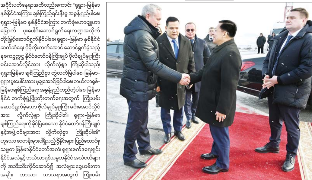
အပိုင်းပတ်နေရာအထိလည်းကောင်း “ရုရှား-မြန်မာ နှစ်နိုင်ငံအကြား ချစ်ကြည်ရင်းနှီးမှု အခွန်ရှည်ပါစေ၊ ရုရှား-မြန်မာ နှစ်နိုင်ငံအကြား ဘက်စုံမဟာဗျူဟာ မြောက် ပူးပေါင်းဆောင်ရွက်ရေးကဏ္ဍအလိုက် တိုးမြှင့်ဆောင်ရွက်နိုင်ပါစေ၊ ရုရှား-မြန်မာ နှစ်နိုင်ငံ ဆက်ဆံရေး ပိုမိုတိုးတက်အောင် ဆောင်ရွက်ခဲ့သည့် နေ့စတင်အတွက် နိုင်ငံတော်ဝန်ကြီးချုပ် ဗိုလ်ချုပ်မှူးကြီး မင်းအောင်လှိုင်အား လှိုက်လှဲစွာ ကြိုဆိုပါသည်။ ရုရှားမြန်မာ ချစ်ကြည်စွာ တွဲလက်ဖြစ်ပါစေ၊ မြန်မာ- ရုရှားပူးပေါင်းအား မျှမျှဆောင်ရွက်ပါစေ၊ ဘယ်လာရစ်- မြန်မာချစ်ကြည်ရေး အခွန်ရှည်တည်တံ့ပါစေ၊ မြန်မာ နိုင်ငံ ဘက်စုံဖွံ့ဖြိုးတိုးတက်ရေးအတွက် ကြိုးပမ်း ဆောင်ရွက်ခဲ့သော ဗိုလ်ချုပ်မှူးကြီး မင်းအောင်လှိုင် အား လှိုက်လှဲစွာ ကြိုဆိုပါ၏။ ရုရှား-မြန်မာ ချစ်ကြည်ရေးကို ခိုင်မြဲစေသော နိုင်ငံတော်ဝန်ကြီးချုပ် နှင့်အဖွဲ့ဝင်များအား လှိုက်လှဲစွာ ကြိုဆိုပါ၏” ဟူသော စာတန်းများ ပါရှိသည့် ဝိုင်းရံများ ပြည်ထောင်စု သမ္မတ မြန်မာနိုင်ငံတော်အလံ၊ ရုရှားဖက်ဒရေးရှင်း နိုင်ငံအလံနှင့် ဘယ်လာရစ် သမ္မတနိုင်ငံ အလံငယ်များ ကို အသီးသီးကိုင်ဆောင်၍ အလံများ ဝှေ့ယမ်းကာ အမျိုး၊ ဘာသာ၊ သာသနာအတွက် ကြိုးပမ်း ဆောင်ရွက်နေသည့် နိုင်ငံတော်စီမံအုပ်ချုပ်ရေး ကောင်စီဥက္ကဋ္ဌ နိုင်ငံတော်ဝန်ကြီးချုပ် ဗိုလ်ချုပ် မှူးကြီး မင်းအောင်လှိုင် ကျန်းမာပါစေ၊ ရုရှား-မြန်မာ ချစ်ကြည်ရေး၊ ဘယ်လာရစ်-မြန်မာချစ်ကြည်ရေး အခွန်ရှည်တည်တံ့ပါစေ၊ ခိုင်မြဲစေဟု ကြွေးကြော် လျက် သောင်းသောင်းဖြဖြ ကြိုဆိုဂုဏ်ပြုနှုတ်ဆက် ခဲ့ကြသည်။

ထိုသို့ ပြန်လည်ရောက်ရှိစဉ် နိုင်ငံတော်စီမံ အုပ်ချုပ်ရေးကောင်စီဥက္ကဋ္ဌ နိုင်ငံတော်ဝန်ကြီးချုပ် ဗိုလ်ချုပ်မှူးကြီး မင်းအောင်လှိုင်အား ရုရှားဖက်ဒရေးရှင်းနိုင်ငံ နိုပိုစီဗစ်မြို့ သာမာရူဗာလေဆိပ်၌ နိုပိုစီဗစ်ဒေသအုပ်ချုပ်ရေးမှူး မစ္စတာ တရာ ဗနီကော့ဗ်အန်ဒရေ အလက်ဇန်ဒရိုဘစ်ချ်က ပို့ဆောင်နှုတ်ဆက်စဉ်။