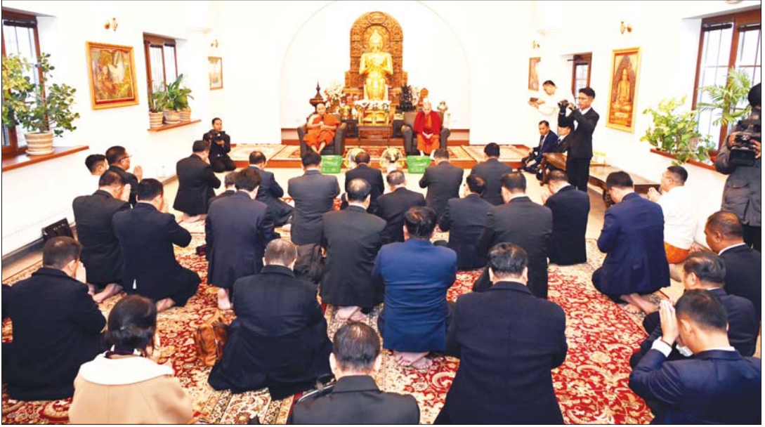
နိုင်ငံတော်စီမံအုပ်ချုပ်ရေးကောင်စီဥက္ကဋ္ဌ နိုင်ငံတော်ဝန်ကြီးချုပ် ဗိုလ်ချုပ်မှူးကြီး မင်းအောင်လှိုင်နှင့် ဧည့်ပရိသတ်များက မော်စကိုမြို့ မြန်မာထေရဝါဒ ဗုဒ္ဓစင်တာ သဒ္ဓမ္မဇောတိကသိမ်တော်အတွင်း၌ ကျောင်းထိုင်ဆရာတော် မဟာသဒ္ဓမ္မဇောတိကဝေ ဒေါက်တာဘဒ္ဒန္တအစ္စရိယထံမှ ငါးပါးသီလခံယူဆောင်တည်ကြစဉ်။ (၃-၃-၂၀၂၅)

၂၀၂၅ ခုနှစ် မတ်လ ၃ ရက်၊ ၁၃၈၆ ခုနှစ် တပေါင်းလဆန်း ၅ ရက်။ အိမ်ခြံမြေအိုင်အိုင် သာယာစင်ကြယ် ငြိမ်းချမ်းလှပသော နေ့ရက် တစ်ရက်။ “ဝန်ပုဂ္ဂိုလ် ယထာဘူတေ ဝိမာန မာသေ ပဋ္ဌမသ္မိဂိမေ - နေ့လများတွင် နွေးအေးဖြစ်သော၊ ကောင်းစွာပွင့်သော၊ ခက်ဖျားစိုရိသော တောအုပ်သည်အသရေ ရှိတိသကဲ့သို့ နိဗ္ဗာန်ရောက်ကြောင်း တရားတော်မြတ်ပိဋကတ်ကို နိဗ္ဗာန် ဓာတ် အမြတ်ဆုံးအကျိုးစီးပွားအလိုမှာ” ဟူ၍ ရတနာသုတ်၌ နေရာသီ၏ အဦးအစ အလှနှင့် အဓိပ္ပာယ်ကို နိဗ္ဗာန်ဓာတ် တရားမြတ်နှင့် ရူပကပြုထားပါသည်။