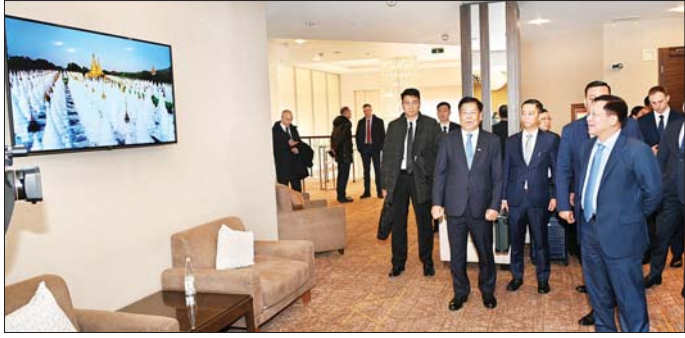
နိုင်ငံတော်စီမံအုပ်ချုပ်ရေးကောင်စီဥက္ကဋ္ဌ နိုင်ငံတော်ဝန်ကြီးချုပ် ပိုလ်ချုပ်မှူးကြီး မင်းအောင်လှိုင်နှင့် အဖွဲ့ဝင်များ နိဗ္ဗိတိဗိမ္ဗိ မြို့ ကောင်စစ်ဝန်ချုပ်ရုံးအတွင်း လှည့်လည်ကြည့်ရှုစဉ်။