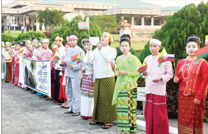
နိုင်ငံတော်စီမံအုပ်ချုပ်ရေးကောင်စီဥက္ကဋ္ဌ နိုင်ငံတော်ဝန်ကြီးချုပ် ဗိုလ်ချုပ်မှူးကြီး မင်းအောင်လှိုင် ဦးဆောင်သည့် မြန်မာအဆင့်မြင့်ကိုယ်စားလှယ်အဖွဲ့အား ပြည်သူများက သောင်းသောင်းဖြူဖြူ ကြိုဆိုဂုဏ်ပြုနှုတ်ဆက်စဉ်။