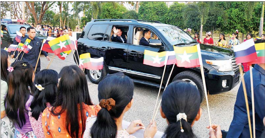
နိုင်ငံတော်စီမံအုပ်ချုပ်ရေးကောင်စီဥက္ကဋ္ဌ နိုင်ငံတော်ဝန်ကြီးချုပ် ဗိုလ်ချုပ်မှူးကြီး မင်းအောင်လှိုင် ဦးဆောင်သည့် မြန်မာ့အဆင့်မြင့်ကိုယ်စားလှယ်အဖွဲ့အား ပြည်သူများက သောင်းသောင်းဖြဖြ ကြိုဆိုစဉ်။

ထို့ပြင် နိုင်ငံတော်စီမံအုပ်ချုပ်ရေးကောင်စီဥက္ကဋ္ဌ နိုင်ငံတော်ဝန်ကြီးချုပ် ဦးဆောင်သည့် မြန်မာ ချစ်ကြည်ရေးကိုယ်စားလှယ်အဖွဲ့သည် နေပြည်တော် မှ ရုရှားဖက်ဒရေးရှင်းနိုင်ငံ နိုပိုစီဗစ်မြို့၊ မော်စကိုမြို့၊ စိန့်ပီတာစဘတ်မြို့၊ ဆာမားရားမြို့နှင့် ဘယ်လာရစ် သမ္မတနိုင်ငံ မင်စ်မြို့များသို့ သွားရောက်ခဲ့ပြီး မိမိတို့ မြန်မာနိုင်ငံနှင့် ရာသီဥတုအခြေအနေအထား၊ ကွာဟချက် အရ အပူချိန်အနုတ် ၂ မှ အနုတ် ၁၂ ဒီဂရီ စင်တီဂရိတ် (အေးခဲသော) အနုတ်အထိရှိသည့် ရုရှား ဖက်ဒရေးရှင်းနိုင်ငံနှင့် ဘယ်လာရစ် သမ္မတနိုင်ငံတို့သို့ အသွားအပြန် မိုင်ပေါင်း တစ်သောင်းကျော်ခန့်အထိ သွားရောက်၍ နိုင်ငံတော်အကျိုးစီးပွားကို တစိုက် မတ်မတ် ဦးတည်ပြီး ခရီးစဉ်အတွင်း နေ့မအား ညမနားဖြင့် နိုင်ငံများအကြား စိုက်ပျိုးရေးကဏ္ဍ၊ စီးပွားရေးကဏ္ဍ၊ ကုန်သွယ်ရေးကဏ္ဍ၊ ပညာသင်ကြား မှု မြှင့်တင်ရေးဆိုင်ရာကိစ္စ၊ ခရီးသွားကဏ္ဍများ တိုးမြှင့်ရေးဆိုင်ရာကိစ္စများတွင် ပြည်သူ့အချင်းချင်း၊ လုပ်ငန်းရှင်များအချင်းချင်း ပူးပေါင်းဆောင်ရွက်နိုင် မည့် အခွင့်အလမ်းများ ပေါ်ပေါက်လာစေရေးအတွက် ကြိုးပမ်းအားထုတ်ဆောင်ရွက်ခဲ့ကြသည့် နိုင်ငံတော် စီမံအုပ်ချုပ်ရေးကောင်စီဥက္ကဋ္ဌ နိုင်ငံတော်ဝန်ကြီးချုပ် ဦးဆောင်သည့် မြန်မာ့အဆင့်မြင့်ကိုယ်စားလှယ် အဖွဲ့အား ဂုဏ်ပြုကြိုဆိုသောအားဖြင့် တိုင်းရင်းသား၊ တိုင်းရင်းသူ သားငယ်၊ သမီးငယ်လေးများ၊ ဘင်ခရာ၊ ပန်းပွားအကအဖွဲ့များ၊ ရိုးရာအကအဖွဲ့များ၊ အနုပညာရှင်များ၊ ဒေသခံပြည်သူများက လေဆိပ် တွင် အသင့်စောင့်ကြည့် လေ့လာအဆင်မဲ့ VIP ဆောင်အထိလည်းကောင်း၊ တပ်မတော်လေဆိပ်မှ