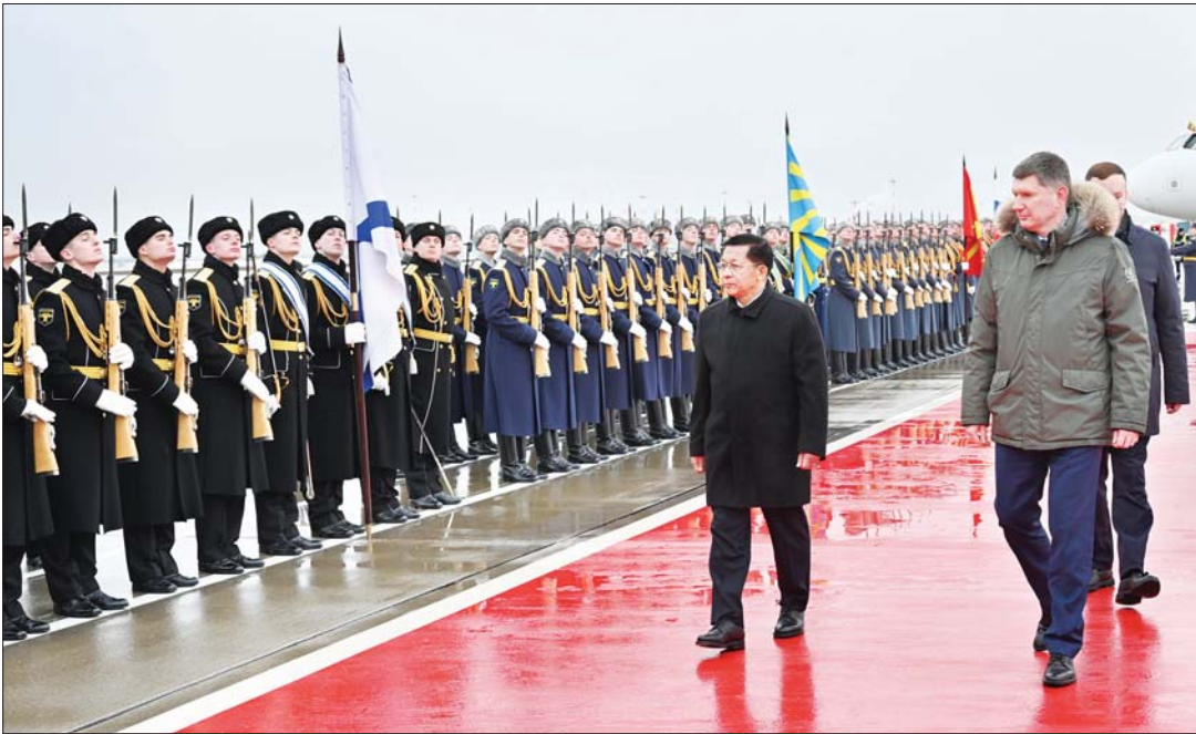
နိုင်ငံတော်စီမံအုပ်ချုပ်ရေးကောင်စီဥက္ကဋ္ဌ နိုင်ငံတော်ဝန်ကြီးချုပ် ဗိုလ်ချုပ်မှူးကြီး မင်းအောင်လှိုင်အား ရုရှားဖက်ဒရေးရှင်းနိုင်ငံ နိုင်ငံတော်ဂုဏ်ပြုတပ်ဖွဲ့က နိုင်ငံတော် အဆင့် ချစ်ကြည်ရေးခရီးစဉ် လာရောက်သည့် နိုင်ငံခေါင်းဆောင်များအား ကြိုဆိုသည့်အစဉ်အလာနှင့်အညီ ဂုဏ်ပြုကြိုဆိုစဉ်။ (၃-၃-၂၀၂၅)

စာမျက်နှာ ၈ မှ အပြည်ပြည်ဆိုင်ရာ သာသနာပြု တက္ကသိုလ် ပါမောက္ခ မဟာဌာနမှူး ဓမ္မဒူတဆရာတော် ခေါက်တာ အရှင် ဆေကိန္ဒတို့၏ ဩဝါဒကို ခံယူ၍ ရည်ရွယ်တည်ဆောက်ခဲ့ခြင်းဖြစ်သည်။ နိုင်ငံတော်အကြီးအကဲနှင့် ဇနီးအား အမှူးထား၍ တပ်မတော်ကြည်း၊ ရေ (လေ) မိသားစုများ၊ ရုရှားဖက်ဒရေးရှင်း နိုင်ငံသံရုံးနှင့် စစ်သံရုံးမိသားစုများ၊ ရုရှား နိုင်ငံတွင် ပညာတော်သင် ရောက်ရှိ နေသည့် သင်တန်းသားမိသားစုများ၏ ပေါင်းစည်းညီညွတ်မှုဖြင့် ၂၀၁၃ ခုနှစ် တွင် စတင်စီစဉ်ကာ ၂၀၁၅ ခုနှစ်တွင် ကျောင်းရေစက်ချ အခမ်းအနားကြီး ကို အောင်မြင်စွာ ကျင်းပနိုင်ခဲ့သည်။ ထို့အတူပင် မြန်မာ့ထေရဝါဒဗုဒ္ဓဝိဟာရ၌ ရဟန်းရှင်လူများ စိတ်အေးချမ်းသာစွာ ဖြင့် တရားအားထုတ်နိုင်ရန် သီတဂူ ဆရာတော်ကြီး၏ ဩဝါဒကို ခံယူ၍ နိုင်ငံတော်အကြီးအကဲနှင့် ဇနီး၊ မြန်မာ သံရုံးနှင့် မြန်မာစစ်သံ (ကြည်း၊ ရေ လေ) မိသားစုများ၊ ရဟန်းရှင်လူပြည်သူ များ၊ ရုရှားနိုင်ငံရောက် ပညာတော်သင် သင်တန်းသားအရာရှိများ စုပေါင်း လှူဒါန်းခဲ့ခြင်းဖြစ်ပြီး ၂၀၂၁ ခုနှစ်တွင် နိုင်ငံတော်အကြီးအကဲနှင့် အလှူရှင်များ က ရေစက်ချလှူဒါန်းခြင်းဖြစ်သည်။ ယခုအခါတွင် ရုရှားနိုင်ငံရှိ ဗုဒ္ဓဘာသာဝင် များသာမက အိမ်နီးချင်းနိုင်ငံများမှ ဗုဒ္ဓဘာသာဝင်များအတွက်ပါ သာသနာ ရေးလုပ်ငန်းများ ဆောင်ရွက်ရာတွင် အလေးထားရသည့် နေရာတစ်ခုဖြစ် ကြောင်း ဝမ်းမြောက်ကြည်နူးဖွယ် သိရှိ ရသည်။ ခရီးစဉ်ပထမနေ့ရက်မှာပင် မိမိတို့ အထွတ်အမြတ်ထားရာဘာသာတရား၏ အရိပ်အဝါသကို ခိုလှုံလိုက်ရသဖြင့် ကိုယ်စားလှယ်တော်ကြီးများမှာ ရေခြား မြေခြားသို့ ရောက်ရှိနေလင့်ကစား စိတ် ဓာတ်ခွန်အားများတိုးပွားလျက်ရှိသည်။ အချိန်မှာ ညဘက်သို့ ချဉ်းကပ်လာပြီ ဖြစ်ရာ အအေးဓာတ်က အနည်းငယ် ပိုလွှမ်းလာသလိုခံစားရသည်။ အခန်း တွင် အပူချိန်ကမူ အနွေးပေးစက်များ