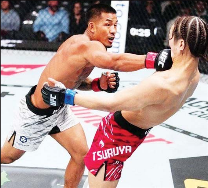
ဂျီဂျာအာဗန်နှင့် တာဆူရူယာ ယှဉ်ပြိုင်ထိုးသတ်စဉ်။

ရန်ကုန် မတ် ၉ UFC 313 ပြိုင်ပွဲကို မြန်မာစံတော်ချိန် မတ် ၉ ရက် နံနက်အစောပိုင်းက အမေရိကန်နိုင်ငံ၌ ကျင်းပရာ မြန်မာဗိုလ်တစ်ယောက် ဂျီဂျာအာဗန် အမှတ်ဖြင့် အနိုင်ရခဲ့သည်။ ဂျီဂျာအာဗန်သည် ဂျပန်ဗိုလ်တစ်ယောက် ဘာဆူရူယာနှင့် ယှဉ်ပြိုင်ထိုးသတ်ရာ အမှတ်ဖြင့် အနိုင်ရခဲ့ခြင်းဖြစ်သည်။ ဂျီဂျာအာဗန်သည် ပြိုင်ဘက်ကစားသမားကို အလဲထိုးနိုင်ခြင်းမရှိသော်လည်း ရမှတ်များရရှိအောင် ထိုးသတ်နိုင်သဖြင့် အမှတ်ဖြင့်ဆုံးဖြတ်ရာတွင် အသာရခဲ့ခြင်းဖြစ်သည်။ ထို့ကြောင့် အမှတ်ဖြင့် ဆုံးဖြတ်ရာတွင် ခိုင်လုံကြီးသုံးဦးစလုံးက ၃၀-၂၇ မှတ်၊ ၃၀-၂၇ မှတ်၊ ၃၀-၂၇ မှတ်ဖြင့် အနိုင်ပေးခဲ့ခြင်းဖြစ်သည်။ ဂျီဂျာအာဗန်သည် UFC တွင် ခုနစ်ပွဲထိုးသတ်ထားရာ ခြောက်ပွဲနိုင်၊ တစ်ပွဲရှုံးနိမ့်ထားပြီး နိုင်ပွဲဆက်နေခြင်းဖြစ်သည်။ ညီမြတ်သော်တာ