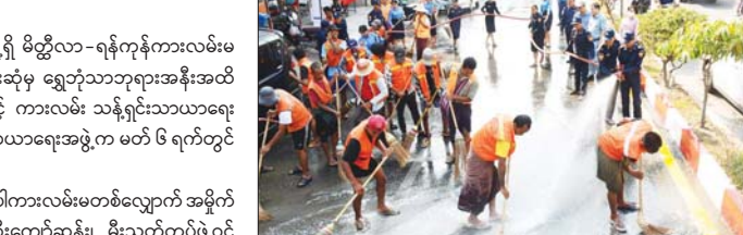
ဒုတိယညွှန်ကြားရေးမှူး ဦးမျိုးထက်စော်နှင့် သက်ဆိုင်ရာဌာန တာဝန်ရှိသူများက ကြည့်ရှုစစ်ဆေးခဲ့ကြောင်း သိရသည်။ ချမ်းသာ(မိတ္ထီလာ)

မိတ္ထီလာ မတ် ၉ မန္တလေးတိုင်းဒေသကြီး မိတ္ထီလာမြို့ရှိ မိတ္ထီလာ-ရန်ကုန်ကားလမ်းမ မြို့မရပ်ကွက် မြို့လယ်ဘုရားလမ်းဆုံမှ ရွှေဘိုသာဘုရားအနီးအထိ ပလတ်စတစ် အမှိုက်ကင်းစင်ရေးနှင့် ကားလမ်း သန့်ရှင်းသာယာရေး လုပ်ငန်းများကို မြို့နယ်စည်ပင်သာယာရေးအဖွဲ့က မတ် ၆ ရက်တွင် ဆောင်ရွက်ခဲ့သည်။ ထိုသို့ဆောင်ရွက်ရာတွင် အဆိုပါကားလမ်းမတစ်လျှောက် အမှိုက်များကို ခရိုင်မီးသတ်ဦးစီးဌာနမှူး ဦးကျော်ဆန်း၊ မီးသတ်တပ်ဖွဲ့ဝင်များနှင့် မြို့နယ်စည်ပင်သာယာရေးအဖွဲ့ သန့်ရှင်းရေးလုပ်သားများက သန့်ရှင်းရေး စုပေါင်းဆောင်ရွက်ကြရာ မြို့နယ်စည်ပင်သာယာရေးအဖွဲ့မှ