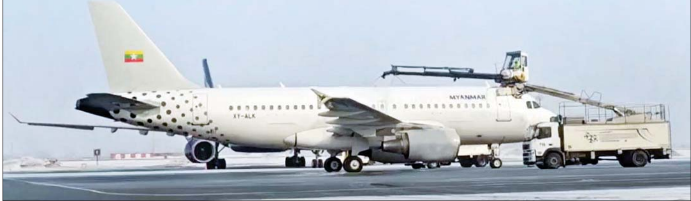
နိုင်ငံတော်စီမံအုပ်ချုပ်ရေးကောင်စီဥက္ကဋ္ဌ နိုင်ငံတော်ဝန်ကြီးချုပ် ဗိုလ်ချုပ်မှူးကြီးမင်းအောင်လှိုင် ဦးဆောင်သည့် မြန်မာ့အဆင့်မြင့်ကိုယ်စားလှယ်အဖွဲ့ စီးနင်းလိုက်ပါလာသည့် အထူးလေယာဉ်အား ရာသီဥတုကြောင့် နှင်းများဖုံးလွှမ်းနေသည့်အတွက် လေဆိပ်မှထွက်ခွာမီ သန့်ရှင်းရေးလုပ်ငန်းများ ဆောင်ရွက်စဉ်။

လည်း မီဒီယာများ၏ မေးမြန်းမှုများကို ပြန်လည် မြေကြားမှအပြည့်အစုံကို စာမျက်နှာ- ၅ တွင် သီးခြားဖော်ပြထားပါသည်။ သတင်းစဉ်