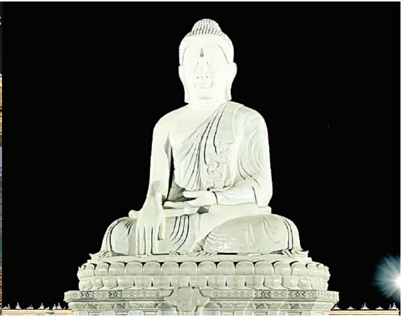
နိုင်ငံတော်စီမံအုပ်ချုပ်ရေးကောင်စီဥက္ကဋ္ဌ နိုင်ငံတော်ဝန်ကြီးချုပ် ဗိုလ်ချုပ်မှူးကြီးမင်းအောင်လှိုင်နှင့် ဇနီး ဒေါ်ကြူကြူလှတို့က မာရဝိဇယဗုဒ္ဓရုပ်ပွားတော်မြတ်ကြီးအား ဖူးမြော်ကြည့်ညိုစဉ်။