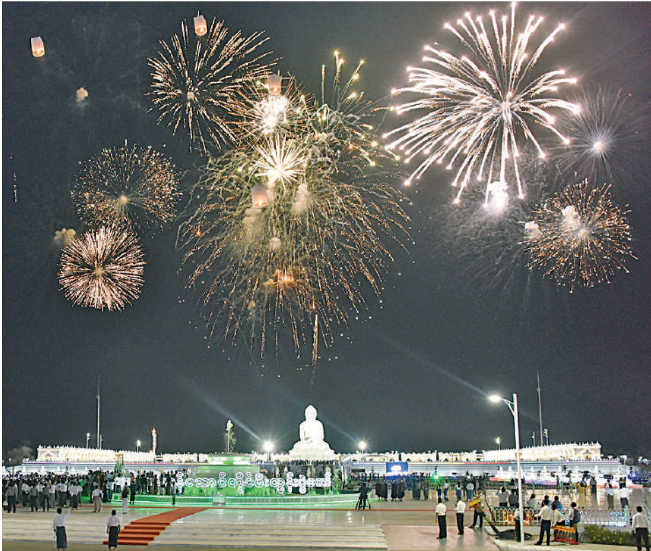
မာရဝိဇယဗုဒ္ဓရုပ်ပွားတော်မြတ်ကြီး တန်ဆောင်တိုင်မီးထွန်းပွဲတော် မီးပုံးပျံလွှတ်တင်ပူဇော်ပွဲတွင် မီးရှူးမီးပန်းများ ပစ်ဖောက်ပူဇော်နေမှုကို တွေ့ရစဉ်။