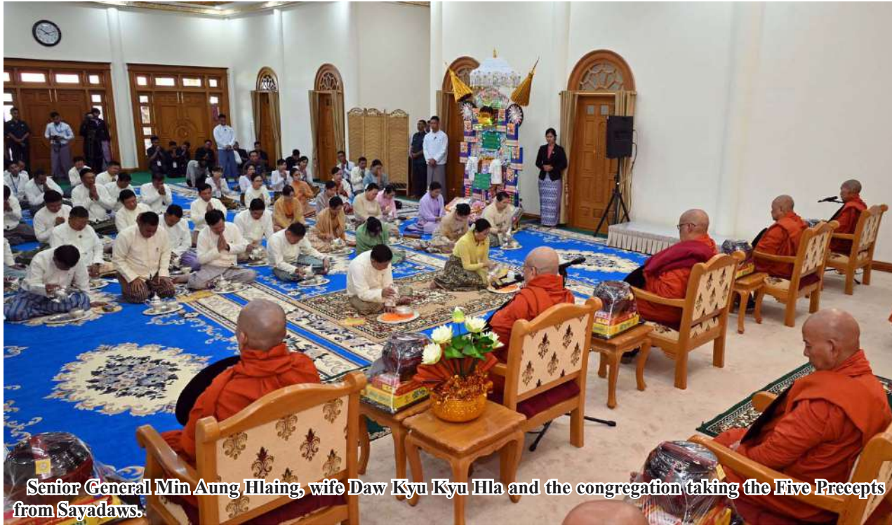
Senior General Min Aung Hlaing, wife Daw Kyu Kyu Hla and the congregation taking the Five Precepts from Sayadaws.

Nay Pyi Taw November 13 In the Union Territory of Dakhinathiri Township, at the Maravijaya Buddha Image, the annual Kathina Robe Offering Ceremony for the year 2024 was held this morning at Maravijaya Monastery within the Maravijaya Buddha Park.