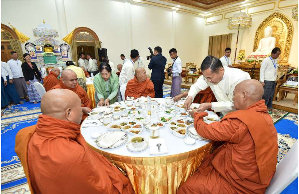
ဆရာတော်၊ သံဃာတော်များအား နိုင်ငံတော်စီမံအုပ်ချုပ်ရေးကောင်စီ ဒုတိယဥက္ကဋ္ဌ ဒုတိယဝန်ကြီးချုပ် ဒုတိယဗိုလ်ချုပ်မှူးကြီးစိုးဝင်းနှင့်ဇနီး ဒေါ်သန်းသန်းနွယ်တို့က နေ့ဆွမ်းဆက်ကပ်လှူဒါန်းစဉ်။