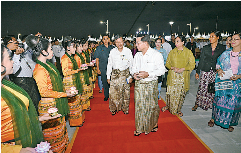
နိုင်ငံတော်စီမံအုပ်ချုပ်ရေးကောင်စီဥက္ကဋ္ဌ နိုင်ငံတော်ဝန်ကြီးချုပ် ဗိုလ်ချုပ်မှူးကြီးမင်းအောင်လှိုင်နှင့် ဇနီး ဒေါ်ကြူကြူလှတို့ကို တိုင်းရင်းသား၊ တိုင်းရင်းသူများက မီးကြာခွက်များကိုင်ဆောင်၍ ကြိုဆိုကြစဉ်။

တော်မြတ်ကြီးအား ဖူးမြော်ကြည့်ညို၍ ပန်းရေချမ်းနှင့်ဆီမီးများကပ်လှူပူဇော်ပြီး စာမျက်နှာ ၁၉ သို့