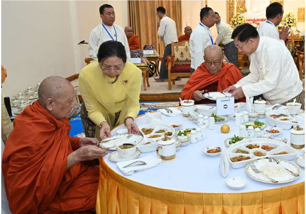
ပေါက်မြိုင်ဆရာတော်ကြီးအမှူးပြုသည့် ဆရာတော်၊ သံဃာတော်များအား နိုင်ငံတော်စီမံအုပ်ချုပ်ရေး ကောင်စီဥက္ကဋ္ဌ နိုင်ငံတော်ဝန်ကြီးချုပ် ဗိုလ်ချုပ်မှူးကြီးမင်းအောင်လှိုင်နှင့်ဇနီး ဒေါ်ကြူကြူလှတို့က နေ့ဆွမ်း ဆက်ကပ်လှူဒါန်းစဉ်။