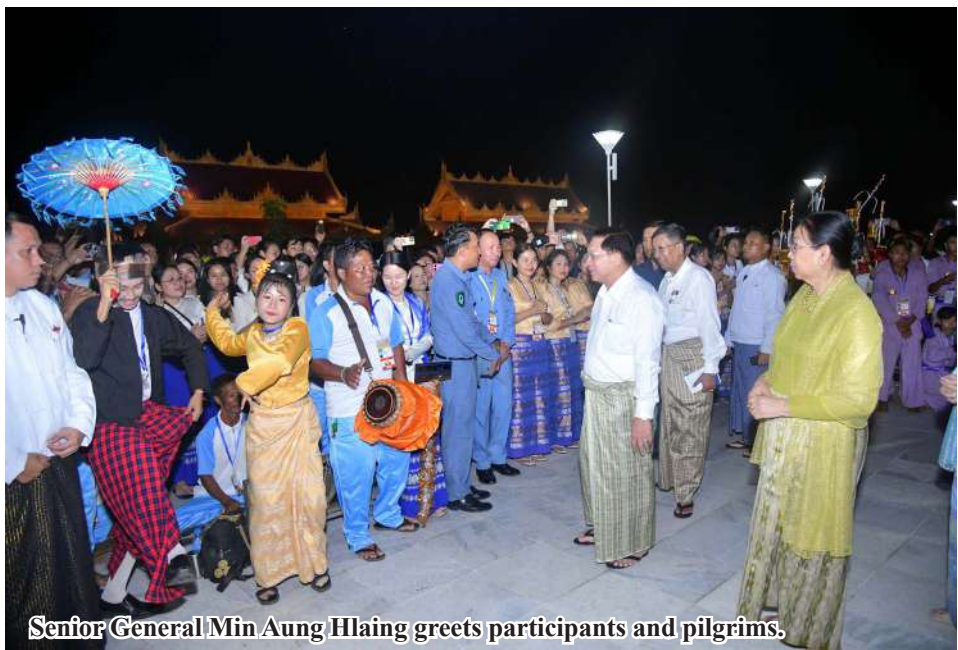
Senior General Min Aung Hlaing greets participants and pilgrims.

Minister Vice-Senior General Soe Win and wife Daw Than Than Nwe, the secretary and joint secretary of the SAC and their wives, members of the SAC and their wives, union ministers and their wives, the chairman of Nay Pyi Taw Council, See Page 14