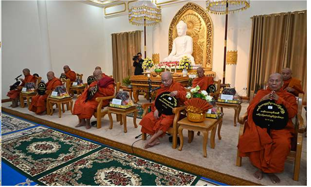
မာရဝိဇယကျောင်းတော် ပဓာနနာယက အဂ္ဂမဟာပဏ္ဍိတ ဘဒ္ဒန္တနေမိန္ဒထံမှ နိုင်ငံတော်စီမံအုပ်ချုပ်ရေးကောင်စီဥက္ကဋ္ဌ နိုင်ငံတော်ဝန်ကြီးချုပ် ဗိုလ်ချုပ်မှူးကြီးမင်းအောင်လှိုင်၊ဇနီး ဒေါ်ကြူကြူလှနှင့် ဧည့်ပရိသတ်များက ငါးပါးသီလခံယူဆောက်တည်ကြစဉ်။