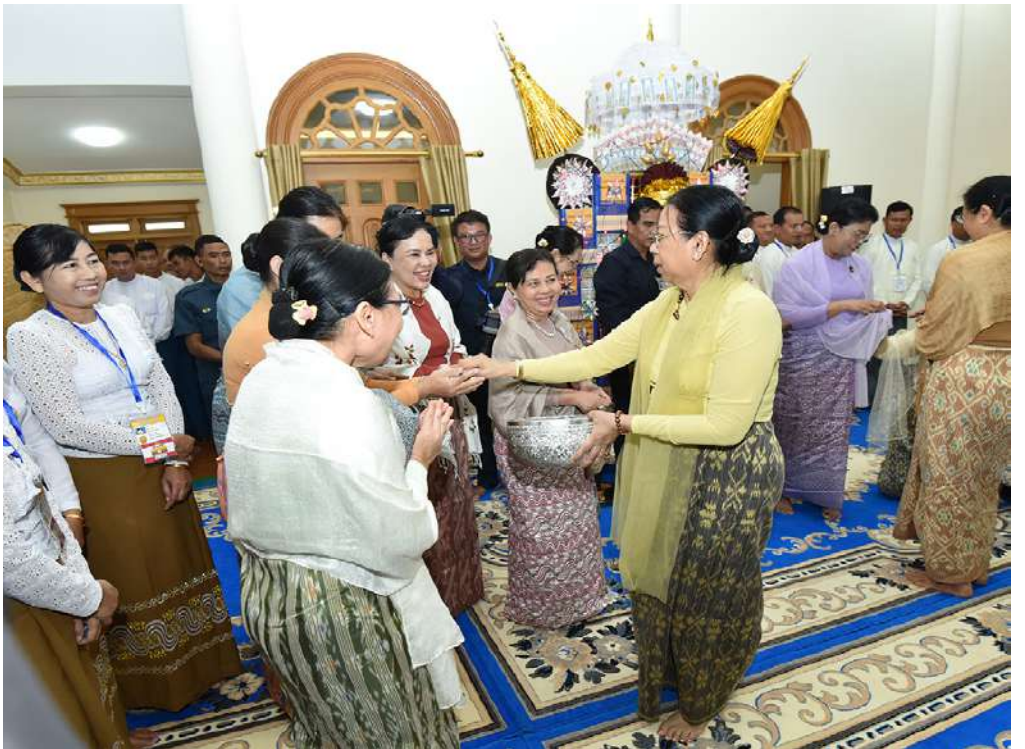
နိုင်ငံတော်စီမံအုပ်ချုပ်ရေးကောင်စီဥက္ကဋ္ဌ နိုင်ငံတော်ဝန်ကြီးချုပ် ဗိုလ်ချုပ်မှူးကြီးမင်းအောင်လှိုင်နှင့်ဇနီး ဒေါ်ကြူကြူလှတို့က ရတနာရွှေမိုးငွေမိုးများ ရွာသွန်းဖြူးစဉ်။

က ဆရာတော်၊ သံဃာတော်များထံ ကထိန် သက်န်းနှင့်လှူဖွယ်ပစ္စည်းများကို အသီးသီး ဆက်ကပ်လှူဒါန်းကြသည်။ ထို့နောက် နိုင်ငံတော်စီမံအုပ်ချုပ်ရေး ကောင်စီဥက္ကဋ္ဌ နိုင်ငံတော်ဝန်ကြီးချုပ်နှင့် အခမ်းအနား တက်ရောက်လာကြသည့် ဧည့်ပရိသတ်အပေါင်းတို့သည် ပျဉ်းမနားမြို့ ပါဠိတက္ကသိုလ် မင်္ဂလာဇေယျပရိယတ္တိ စာသင်တိုက်ပဓာနနာယက အဂ္ဂမဟာပဏ္ဍိတ အဂ္ဂမဟာဘဒ္ဒမ္မဇောတိကဓဇ ဘဒ္ဒန္တဝိမလဗုဒ္ဓိ ဆရာတော်ကြီးထံမှ အနုမောဒနာတရားနာကြားသည်။ ၎င်းနောက် မာရဝိဇယကျောင်းထိုင် ဆရာတော်ကြီးထံမှ ရေစက်ချတရား နာယူ၍ လှူဒါန်းမှုအစုစုအတွက် ရေစက် သွန်းချအမျှပေးဝေကြသည်။ ယင်းနောက် အခမ်းအနားကို “ဗုဒ္ဓ သာသနံစီရိတိဋ္ဌတု” သုံးကြိမ်ရွတ်ဆို ဆရာတော်ကြီးအမျိုးပြုသည့် ဆရာတော်၊ သံဃာတော်များအား နိုင်ငံတော်စီမံအုပ်ချုပ်ရေးကောင်စီဥက္ကဋ္ဌ နိုင်ငံတော်ဝန်ကြီးချုပ် နှင့်ဇနီး၊ ဧည့်ပရိသတ်များက နေ့ဆွမ်း ဆက်ကပ်လှူဒါန်းခဲ့ကြကြောင်း သတင်း ပေါက်မြိုင် ရရှိသည်။ ဆရာတော်ကြီးအမျိုးပြုသည့် ဆရာတော်၊ သံဃာတော်များအား နိုင်ငံတော်စီမံအုပ်ချုပ်ရေးကောင်စီဥက္ကဋ္ဌ နိုင်ငံတော်ဝန်ကြီးချုပ် နှင့်ဇနီး၊ ဧည့်ပရိသတ်များက နေ့ဆွမ်း ဆက်ကပ်လှူဒါန်းခဲ့ကြကြောင်း သတင်း ပေါက်မြိုင် ရရှိသည်။ ဆရာတော်ကြီးအမျိုးပြုသည့် ဆရာတော်၊ သံဃာတော်များအား နိုင်ငံတော်စီမံအုပ်ချုပ်ရေးကောင်စီဥက္ကဋ္ဌ နိုင်ငံတော်ဝန်ကြီးချုပ် နှင့်ဇနီး၊ ဧည့်ပရိသတ်များက နေ့ဆွမ်း ဆက်ကပ်လှူဒါန်းခဲ့ကြကြောင်း သတင်း ပေါက်မြိုင် ရရှိသည်။ ဆရာတော်ကြီးအမျိုးပြုသည့် ဆရာတော်၊ သံဃာတော်များအား နိုင်ငံတော်စီမံအုပ်ချုပ်ရေးကောင်စီဥက္ကဋ္ဌ နိုင်ငံတော်ဝန်ကြီးချုပ် နှင့်ဇနီး၊ ဧည့်ပရိသတ်များက နေ့ဆွမ်း ဆက်ကပ်လှူဒါန်းခဲ့ကြကြောင်း သတင်း ပေါက်မြိုင် ရရှိသည်။