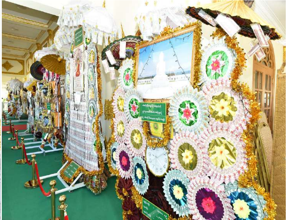
နိုင်ငံတော်စီမံအုပ်ချုပ်ရေးကောင်စီဥက္ကဋ္ဌ နိုင်ငံတော်ဝန်ကြီးချုပ် ဗိုလ်ချုပ်မှူးကြီးမင်းအောင်လှိုင် ကထိန်ခံ မာရဝိဇယကျောင်းတော်ကြီးသို့ လှူဒါန်းရန်ခင်းကျင်းပြင်ဆင်ထားသည့် ကထိန်လျာသင်္ကန်း၊ လှူဖွယ်ပစ္စည်းများနှင့် ပဒေသာပင်များကို လှည့်လည်ကြည့်ရှုစဉ်။