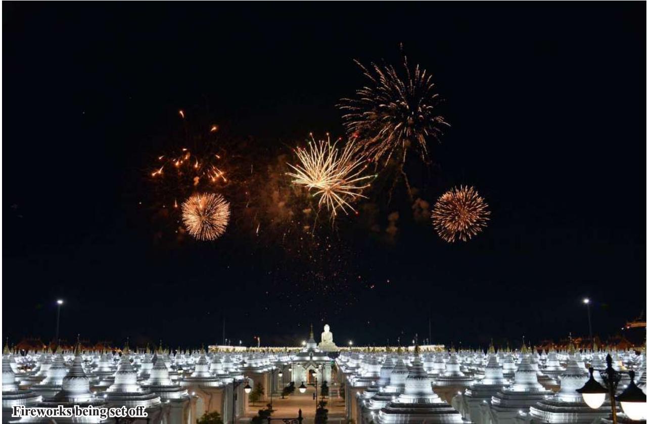
Fireworks being set off.

Then, the Senior General and wife paid obeisance to the Maravijaya Buddha image and offered flowers, water and lights before walking around the precinct of the Buddha image and offering oil lights together with participants of the event including monks and laypersons on pilgrim.