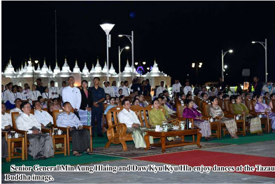
Senior General Min Aung Hlaing and Daw Kyu Kyu Hla enjoy dances at the Tazaungdaing Light Festival and hot-air balloon launching opening ceremony of Maravijaya Buddha image.