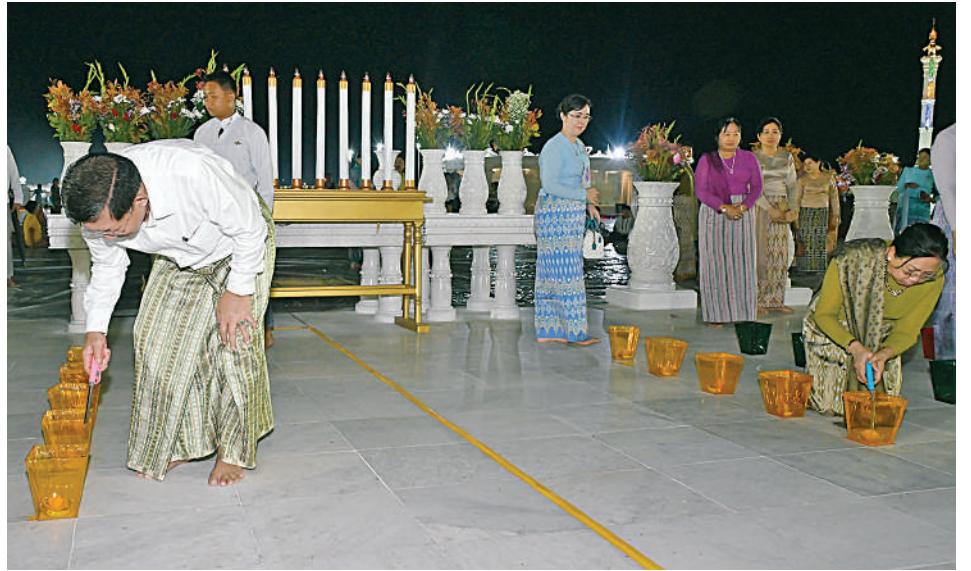
နိုင်ငံတော်စီမံအုပ်ချုပ်ရေးကောင်စီဥက္ကဋ္ဌ နိုင်ငံတော်ဝန်ကြီးချုပ် ဗိုလ်ချုပ်မှူးကြီးမင်းအောင်လှိုင်နှင့် ဇနီး ဒေါ်ကြူကြူလှတို့က မာရဝိဇယဗုဒ္ဓရုပ်ပွားတော်မြတ်ကြီး တန်ဆောင်တိုင်မီးထွန်းပွဲတော် ဖွင့်ပွဲအခမ်းအနားသို့ တက်ရောက်လာကြသူများနှင့်အတူ ဆီမီးများ အတူတကွထွန်းညှိပူဇော်စဉ်။