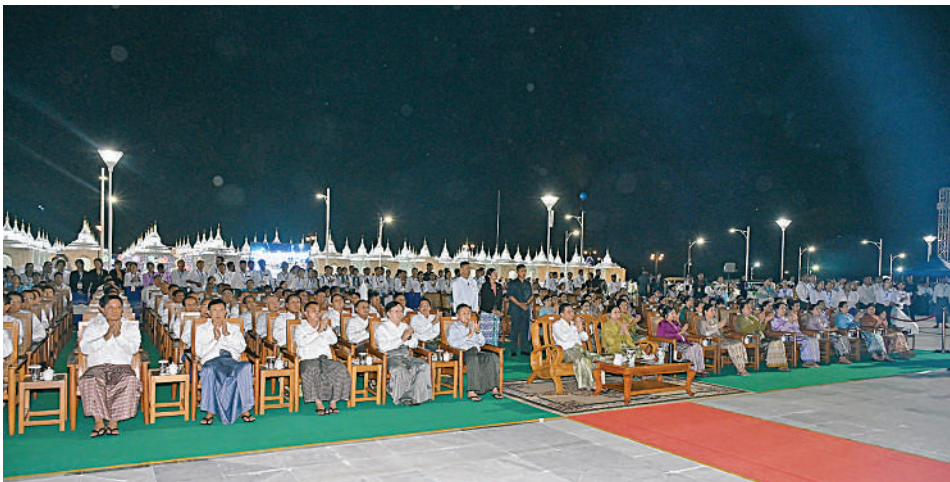
နိုင်ငံတော်စီမံအုပ်ချုပ်ရေးကောင်စီဥက္ကဋ္ဌ နိုင်ငံတော်ဝန်ကြီးချုပ် ဗိုလ်ချုပ်မှူးကြီးမင်းအောင်လှိုင်နှင့် ဇနီးဒေါ်ကြာကြာလှ၊ အခမ်းအနားတက်ရောက်လာကြသူများက မီးပုံးပျံလွှတ်တင်ပူဇော်ယှဉ်ပြိုင်နေမှုကို ကြည့်ရှုအားပေးစဉ်။