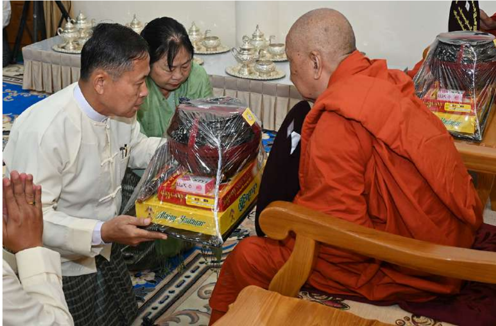
လယ်ဝေးမြို့ အင်းသာအရှေ့ကျောင်းတိုက်ဆရာတော် အဘိဓဇအဂ္ဂမဟာသဒ္ဓမ္မဇောတိက ဘဒ္ဒန္တပဏ္ဍိတထံ နိုင်ငံတော်စီမံအုပ်ချုပ်ရေးကောင်စီ ဒုတိယဥက္ကဋ္ဌ ဒုတိယဝန်ကြီးချုပ် ဒုတိယဗိုလ်ချုပ်မှူးကြီးစိုးဝင်းနှင့်ဇနီး ဒေါ်သန်းသန်းနွယ်တို့က ကထိန်သင်္ကန်းနှင့် လှူဖွယ်ပစ္စည်းများ ဆက်ကပ်လှူဒါန်းစဉ်။