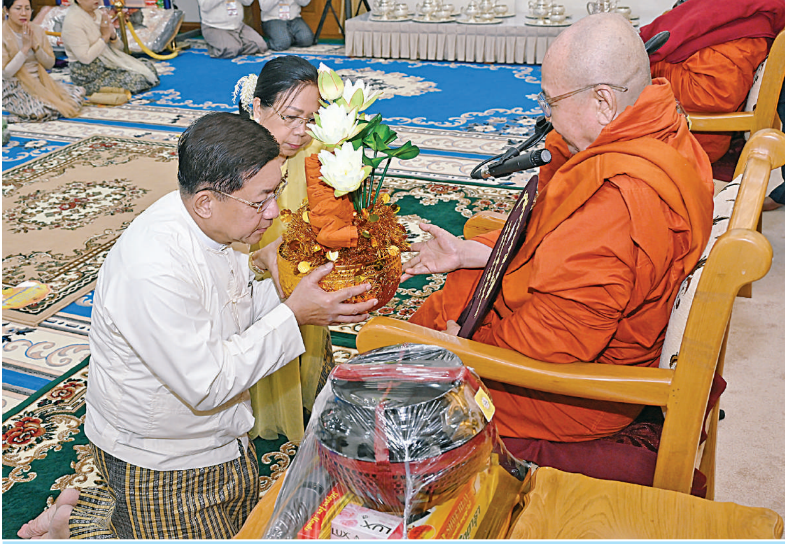
ကထိန်အလှူခံကျောင်း မာရဝိဇယကျောင်းတော် ကျောင်းထိုင်ဆရာတော် အဂ္ဂမဟာပဏ္ဍိတ ဘဒ္ဒန္တဇနိန္ဒထံ နိုင်ငံတော်စီမံအုပ်ချုပ်ရေးကောင်စီဥက္ကဋ္ဌ နိုင်ငံတော်ဝန်ကြီးချုပ် ဗိုလ်ချုပ်မှူးကြီးမင်းအောင်လှိုင်နှင့် ဇနီး ဒေါ်ကြူကြူလှတို့က ကထိန်လှူဒါန်းနှင့် လှူဖွယ်ပစ္စည်းများ ဆက်ကပ်လှူဒါန်းစဉ်။

နေပြည်တော် နိုဝင်ဘာ ၁၃ ပြည်ထောင်စုနယ်မြေ နေပြည်တော် ဒက္ခိဏသီရိမြို့နယ်ရှိ မာရဝိဇယဗုဒ္ဓရုပ်ပွားတော်မြတ်ကြီး မာရဝိဇယဗုဒ္ဓရုပ်ပွားတော်အတွင်းရှိ မာရဝိဇယကျောင်းတော် ၂၀၂၄ ခုနှစ် ကထိန်သင်္ကန်းဆက်ကပ်လှူဒါန်းပွဲအခမ်းအနားကို ယနေ့နံနက်ပိုင်းတွင် အဆိုပါမာရဝိဇယကျောင်းတော်၌ ကျင်းပပြုလုပ်ရာ နိုင်ငံတော်စီမံအုပ်ချုပ်ရေးကောင်စီဥက္ကဋ္ဌ နိုင်ငံတော်ဝန်ကြီးချုပ် ဗိုလ်ချုပ်မှူးကြီးမင်းအောင်လှိုင်နှင့် ဇနီး ဒေါ်ကြူကြူလှတို့ တက်ရောက်၍ ကထိန်လှူဒါန်းနှင့် လှူဖွယ်ပစ္စည်းများ ဆက်ကပ်လှူဒါန်းသည်။ အခမ်းအနားသို့ လယ်ဝေးမြို့ ပေါက်မြိုင်ကျောင်းတိုက် ပဓာနနာယက အဘိဇေမဟာရဋ္ဌဂုရု ဘဒ္ဒန္တဇနိန္ဒ အမှူးပြုသည့် ဆရာတော်ကြီးများနှင့်မာရဝိဇယကျောင်းတော်တွင် သီတင်းသုံးတော်မူကြသည့် ဆရာတော်ကြီးများ ကြွရောက်ချီးမြှင့်တော်မူကြပြီး နိုင်ငံတော်စီမံအုပ်ချုပ်ရေးကောင်စီဥက္ကဋ္ဌ နိုင်ငံတော်ဝန်ကြီးချုပ် ဗိုလ်ချုပ်မှူးကြီးမင်းအောင်လှိုင်၊ ဇနီး ဒေါ်ကြူကြူလှတို့နှင့်အတူ နိုင်ငံတော်စီမံအုပ်ချုပ်ရေးကောင်စီ ဒုတိယဥက္ကဋ္ဌ ဒုတိယဝန်ကြီးချုပ် ဒုတိယဗိုလ်ချုပ်မှူးကြီးစိုးဝင်းနှင့် ဇနီး ဒေါ်သန်းသန်းနွယ်၊ စာမျက်နှာ ၁၆ ကော်လံ ၁