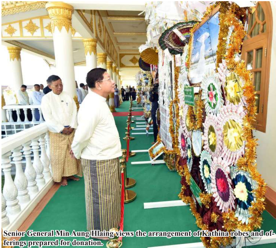
Senior General Min Aung Hlaing views the arrangement of Kathina robes and offerings prepared for donation.