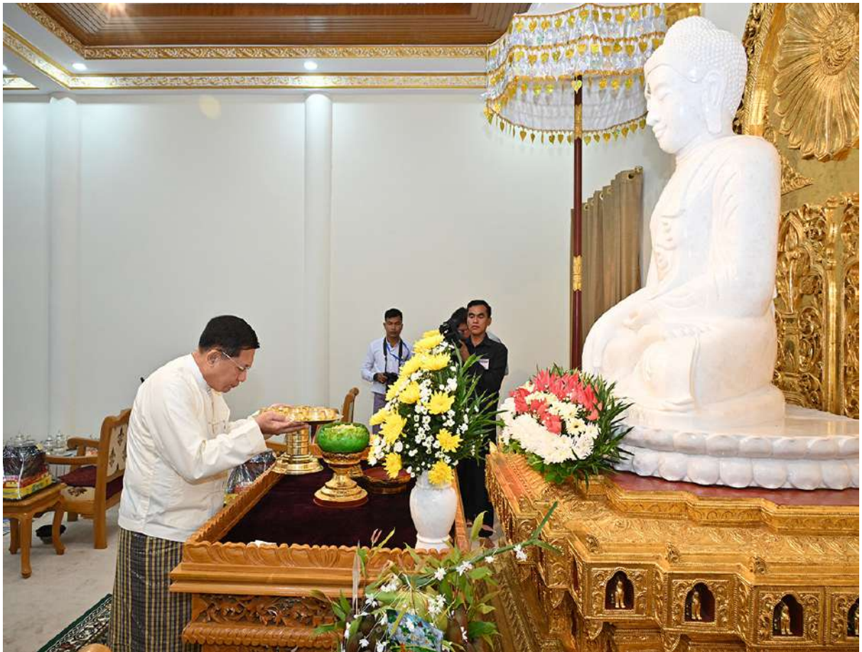
နိုင်ငံတော်စီမံအုပ်ချုပ်ရေးကောင်စီဥက္ကဋ္ဌ နိုင်ငံတော်ဝန်ကြီးချုပ် ဗိုလ်ချုပ်မှူးကြီးမင်းအောင်လှိုင် မာရဝိဇယကျောင်းဆောင်တော် အတွင်းရှိ ဗုဒ္ဓရုပ်ပွားတော်မြတ်အား မြသပိတ်ဆွမ်းတော်၊ သစ်သီးနှင့် ပန်းမန်၊ သောက်တော်ရေချမ်းများ ကပ်လှူပူဇော်စဉ်။

ဆက်လက်ပြီး ကောင်စီအတွင်းရေးမှူး နှင့်ဇနီး၊ တွဲဖက်အတွင်းရေးမှူးနှင့်ဇနီး၊ ကောင်စီဝင်များ၊ ပြည်ထောင်စုဝန်ကြီးများ