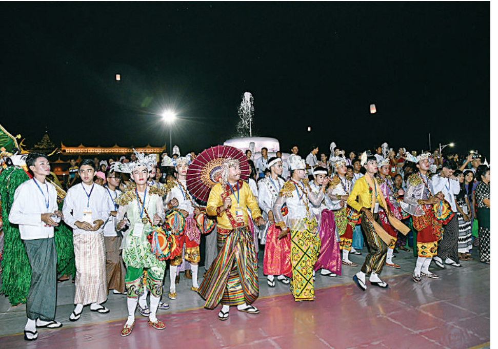
တိုင်းရင်းသားရိုးရာယဉ်ကျေးမှုအဖွဲ့များက ဦးရွှေရိုး၊ ဒေါ်မိုးအက၊ တိုင်းရင်းသားရိုးရာအကအလှများ၊ အိုးစည်ဒိုးပတ်များဖြင့် တီးမှုတ်၍ ကြိုဆိုကြစဉ်။

စာမျက်နှာ ၁၈ မှအဆက် ရင်ပြင်တော်ကြီးပေါ်၌ လှည့်လည်ဖူးမြော်ကြည့်ည့်၍ မာရဝိဇယဗုဒ္ဓရုပ်ပွားတော်မြတ်ကြီး တန်ဆောင်တိုင်မီးထွန်းပွဲတော် ဖွင့်ပွဲအခမ်းအနားသို့ တက်ရောက်လာကြသူများနှင့်အတူ ဆီမီးများကို အတူတကွ ထွန်းညှိပူဇော်ကြသည်။ ထို့နောက် နိုင်ငံတော်စီမံအုပ်ချုပ်ရေးကောင်စီဥက္ကဋ္ဌ နိုင်ငံတော်ဝန်ကြီးချုပ်နှင့်