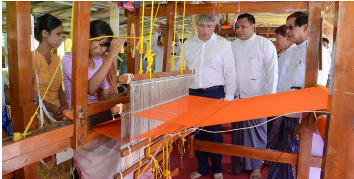
ရုရှားဖက်ဒရေးရှင်းနိုင်ငံ ဘူရားတီးရားပြည်နယ်အကြီးအကဲ Mr. Alexey Sambuevich Tsydenov ဦးဆောင်သော ကိုယ်စားလှယ်အဖွဲ့ (၃၆)ကြိမ်မြောက် မသိုးသင်္ကန်းရက်လုပ်နေမှုကို ကြည့်ရှုအားပေးစဉ်။

ပြီး ဧည့်သည်တော်မှတ်တမ်းတွင် လက်မှတ်ရေးထိုးသည်။ ယင်းနောက် ဧည့်သည်တော်များအား ဂေါပကအဖွဲ့က ရွှေတိဂုံစေတီတော်မြတ်ပုံတော်ကို အမှတ်တရလက်ဆောင်အဖြစ် ပေးအပ်သည်။ ထို့နောက် ရုရှားဖက်ဒရေးရှင်းနိုင်ငံ ဘူရားတီးရားပြည်နယ် အကြီးအကဲနှင့်အဖွဲ့သည် (၃၆)ကြိမ်မြောက် မသိုးသင်္ကန်းရက်လုပ်နေမှုကို ကြည့်ရှုအားပေးကြသည်။ ယင်းနောက် ဗိုလ်ချုပ်ဈေးသို့ရောက်ရှိပြီး ဈေးအတွင်း ခင်းကျင်းပြသရောင်းချလျက်ရှိသည့် လက်ဝတ်ရတနာများ၊ ကျောက်စိမ်းပန်းပုနှင့် လည်ဆွဲပစ္စည်းများ၊ ရိုးရာအဝတ်အထည်များ၊ ရွှေချည်ငွေချည်ထိုးလက်ရာပစ္စည်းများ၊ ယွန်းထည်ပစ္စည်းများ၊ မြန်မာ့ရိုးရာလက်မှုပစ္စည်းများ၊