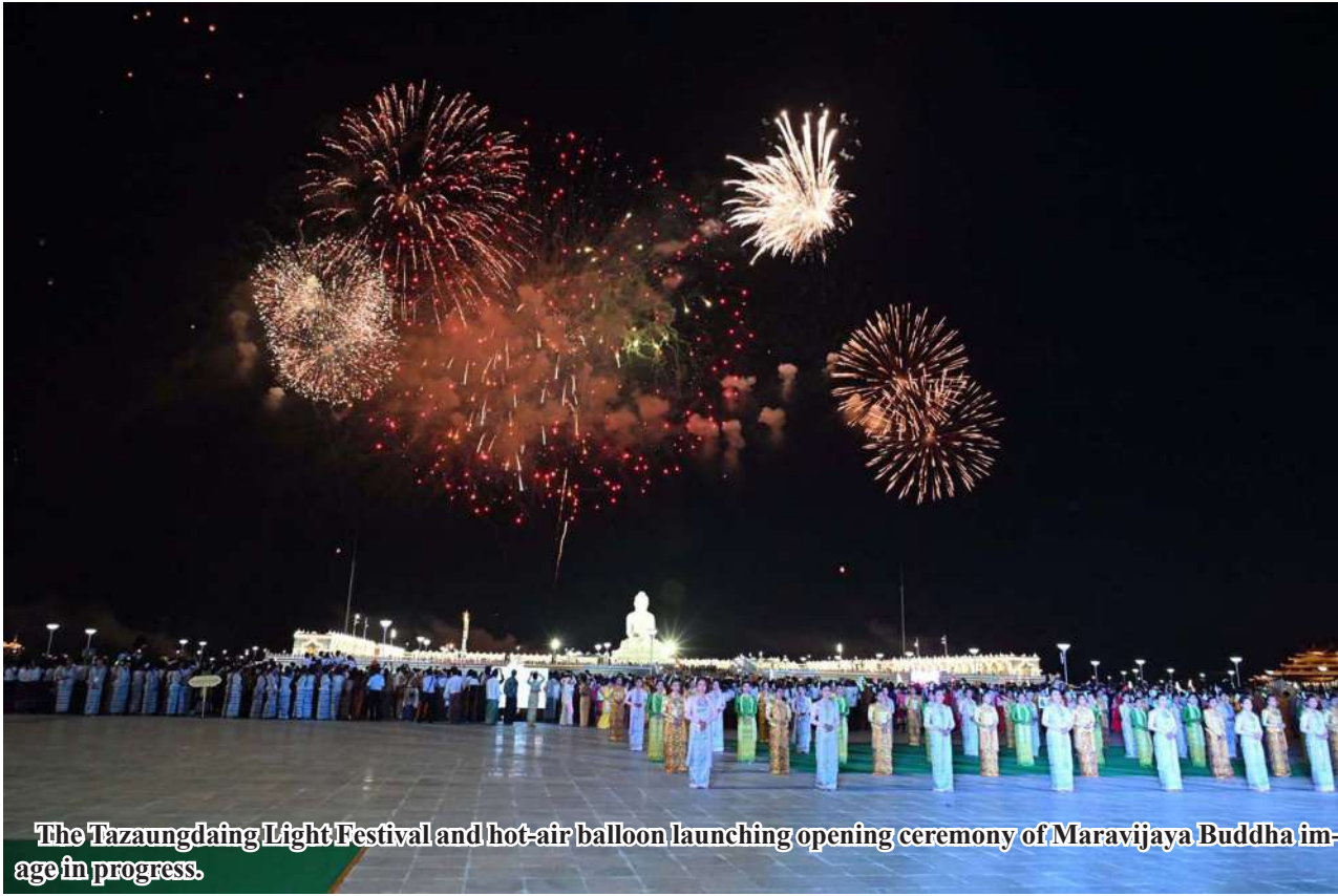
The Tazaungdaing Light Festival and hot-air balloon launching opening ceremony of Maravijaya Buddha image in progress.