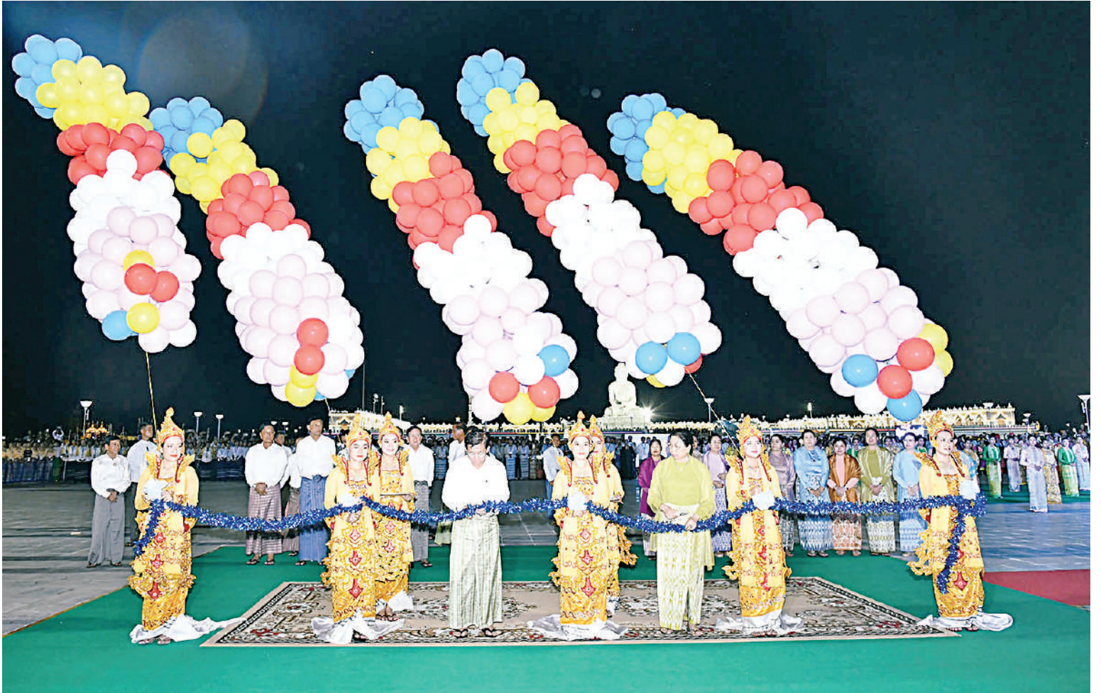
နိုင်ငံတော်စီမံအုပ်ချုပ်ရေးကောင်စီဥက္ကဋ္ဌ နိုင်ငံတော်ဝန်ကြီးချုပ် ဗိုလ်ချုပ်မှူးကြီးမင်းအောင်လှိုင်နှင့် ဇနီး ဒေါ်ကြူကြူလှတို့က မာရဝိဇယဗုဒ္ဓရုပ်ပွားတော်မြတ်ကြီး တန်ဆောင်တိုင်မီးထွန်းပွဲတော် မီးပုံးပျံလွှတ်တင်ပူဇော်ခြင်းဖွင့်ပွဲအခမ်းအနားကို ဖဲကြိုးဖြတ်ဖွင့်လှစ်ပေးစဉ်။

များဆောင်ရွက်နေချိန်တွင် တိုင်းရင်းသား ဖျော်ဖြေတင်ဆက်ခဲ့ကြသည်။