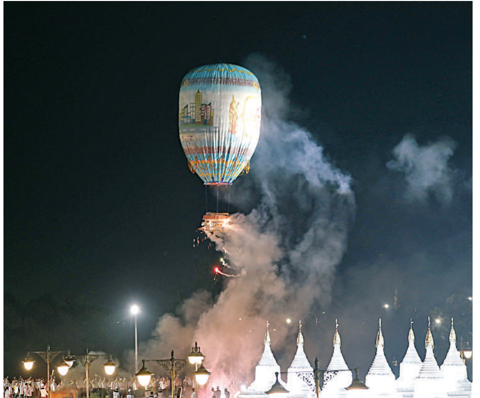
မာရဝိဇယဗုဒ္ဓရုပ်ပွားတော်မြတ်ကြီး တန်ဆောင်တိုင်မီးထွန်းပွဲတော် မီးပုံးပျံလွှတ်တင်ပူဇော်ပွဲတွင် မီးပုံးပျံများ လွှတ်တင်ပူဇော်ယှဉ်ပြိုင်နေမှုကို တွေ့ရစဉ်။