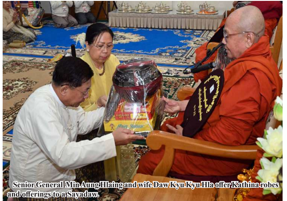
Senior General Min Aung Hlaing and wife Daw Kyu Kyu Hla offer Kathina robes and offerings to a Sayadaw.

Afterwards, they shared merits gained from the donations.