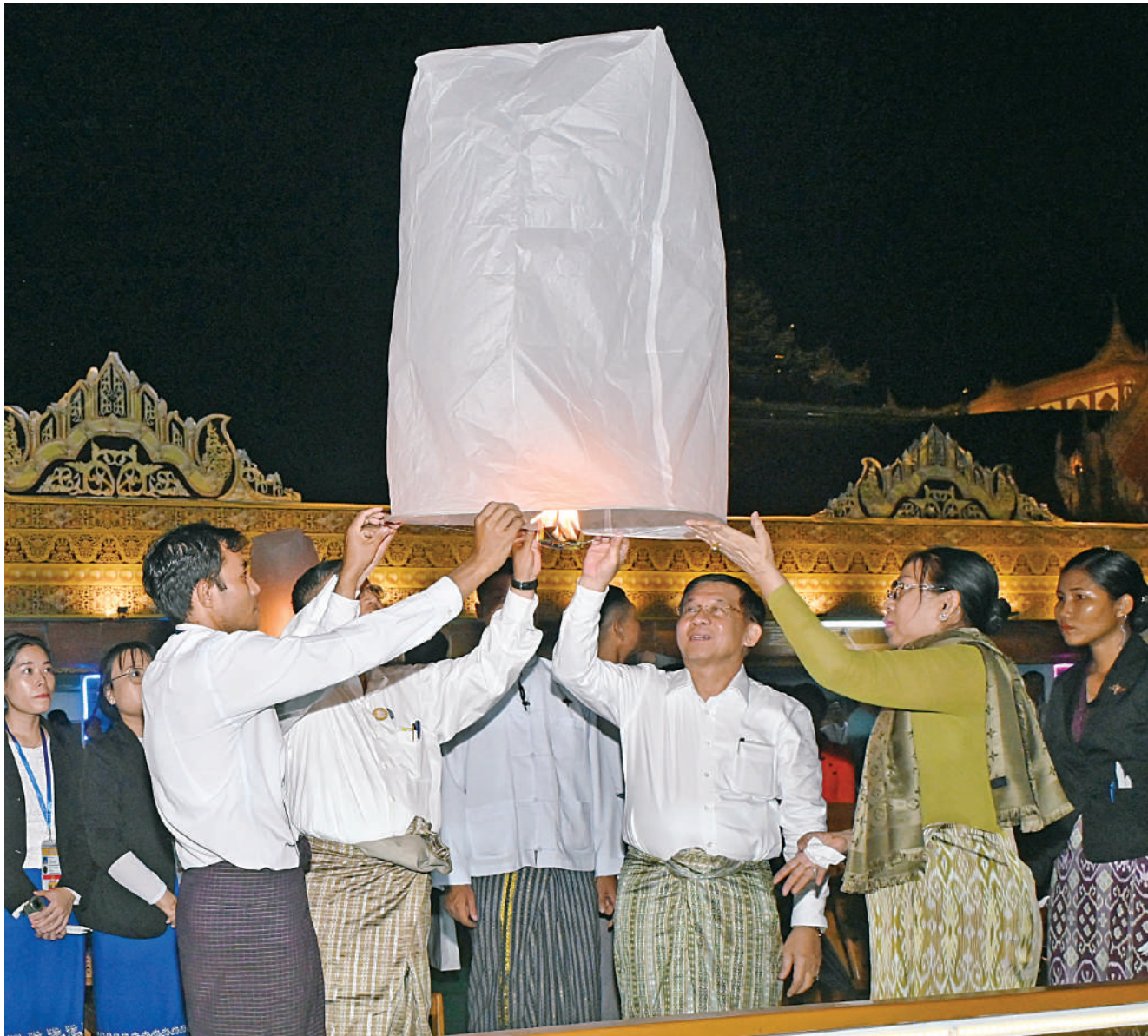
နိုင်ငံတော်စီမံအုပ်ချုပ်ရေးကောင်စီဥက္ကဋ္ဌ နိုင်ငံတော်ဝန်ကြီးချုပ် ဗိုလ်ချုပ်မှူးကြီးမင်းအောင်လှိုင်နှင့် ဇနီး ဒေါ်ကြူကြူလှတို့က မီးပုံးပျံငယ်လွှတ်တင်ပူဇော်စဉ်။