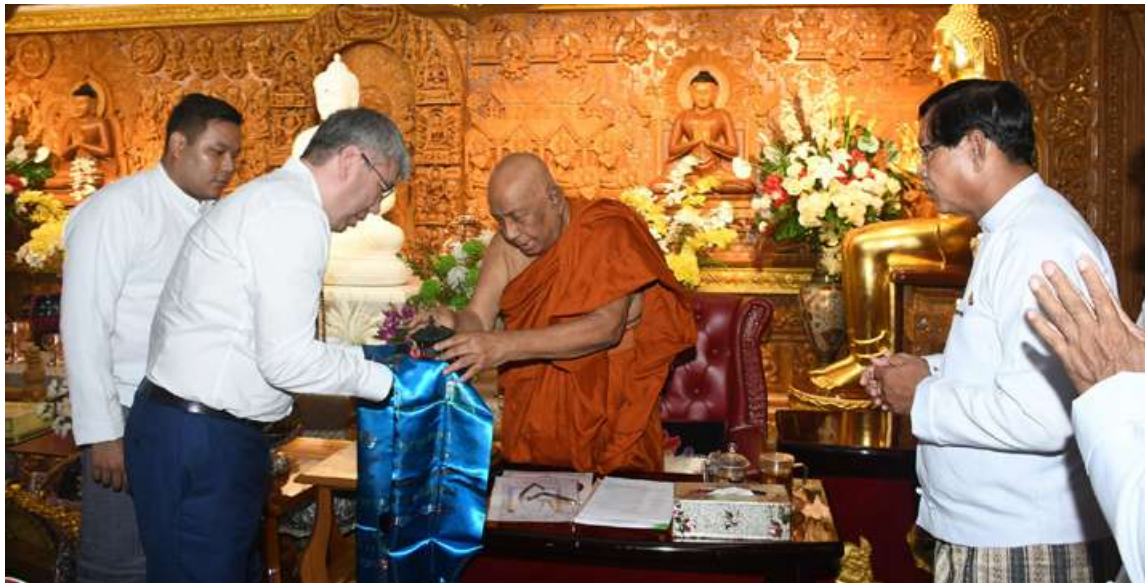
သီတဂူဆရာတော် ဒေါက်တာ ဘဒ္ဒန္တဉာဏိဿရထံ ရုရှားဖက်ဒရေးရှင်းနိုင်ငံ ဘူရားတီးရားပြည်နယ်အကြီးအကဲ Mr. Alexey Sambuevich Tsydenov က လှူဖွယ်ပစ္စည်းများ ဆက်ကပ်လှူဒါန်းစဉ်။

နေပြည်တော် နိုဝင်ဘာ ၁၃ ရုရှားဖက်ဒရေးရှင်းနိုင်ငံ ဘူရားတီးရားပြည်နယ်အကြီးအကဲ Mr. Alexey Sambuevich Tsydenov ဦးဆောင်သော ကိုယ်စားလှယ်အဖွဲ့သည် ယနေ့တွင် ရွှေတိဂုံစေတီတော်မြတ်ကြီးအား ဖူးမြော်၍ ရန်ကုန်မြို့အတွင်း လှည့်လည်ကြည့်ရှုလေ့လာသည်။ နံနက်ပိုင်းတွင် ရုရှားဖက်ဒရေးရှင်းနိုင်ငံ ဘူရားတီးရားပြည်နယ်အကြီးအကဲသည် ရွှေတိဂုံစေတီတော်မြတ်သို့ရောက်ရှိရာ ရန်ကုန်တိုင်းဒေသကြီးဝန်ကြီးချုပ် ဦးစိုးသိန်းနှင့်ဝန်ကြီးများ၊ ဘူရားဂေါပကအဖွဲ့မှတာဝန်ရှိသူများက ကြိုဆိုနှုတ်ဆက်ကြသည်။ ထို့နောက် ရွှေတိဂုံစေတီတော်မြတ်ကြီးအား ဖူးမြော်ကြည့်ရှု၍ ဆီမီး၊ ပန်း၊ ရေချမ်းနှင့် သစ်သီးများ ဆက်ကပ်လှူဒါန်း