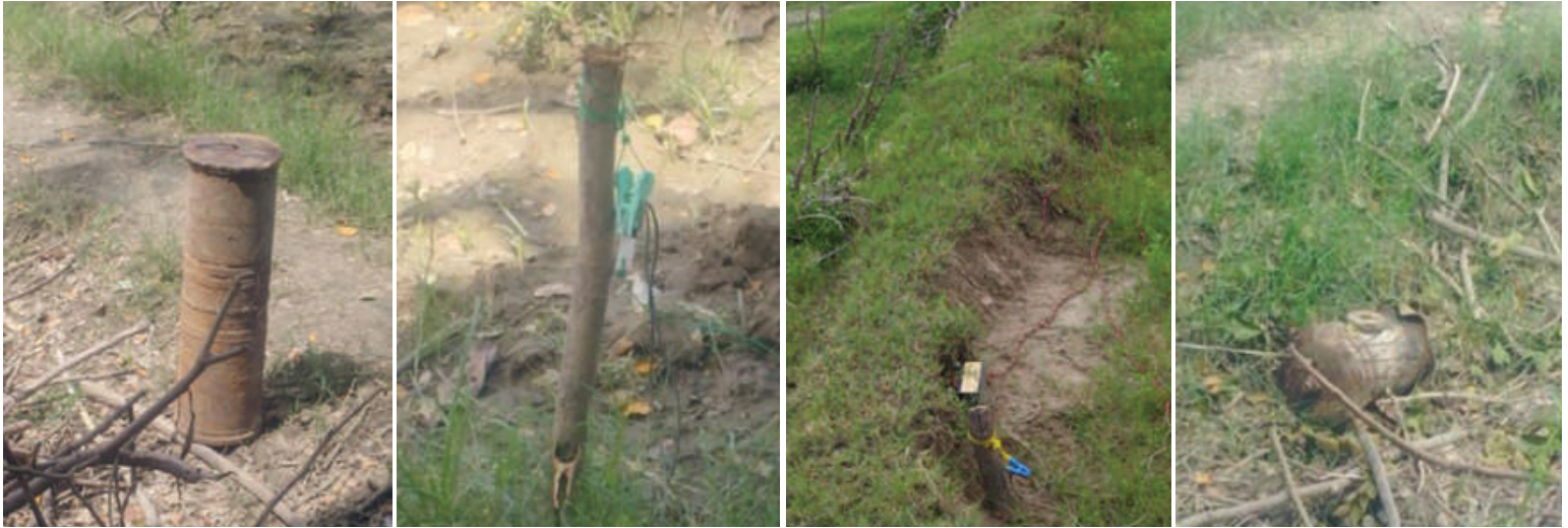
ဧရာဝတီမြစ်ကြောင်းတစ်လျှောက်ရှိ ကျေးရွာများတွင် အကြမ်းဖက်သမားများ ထောင်ထားသည့် လက်လုပ်မိုင်းများကို တွေ့ရစဉ်။

PDF အမည်ခံအကြမ်းဖက်သမားများ သည် ဧရာဝတီမြစ်ကြောင်းတစ်လျှောက်ရှိ ကျေးရွာများတွင် ခိုအောင်းလှုပ်ရှားနေပြီး လူနေအိမ်များ၊ စာသင်ကျောင်းများနှင့် ဘာသာရေး အဆောက်အအုံများကို အကာအကွယ်ယူ၍ ပြည်သူလူထု အသုံးပြုနေသော စစ်ရေးနှင့်မသက်ဆိုင် သည့် ခရီးသွားသင်္ဘောများ၊ ကုန်စည် ပို့ဆောင်ရေး သင်္ဘောများကို ပစ်ခတ် တိုက်ခိုက်ခြင်းများ ကျူးလွန်ခဲ့ရာ ၂၀၂၁ ခုနှစ်မှစ၍ ယနေ့အချိန်ထိ စုစုပေါင်း ၁၄၆ ကြိမ် လုပ်ဆောင်ခဲ့ကြောင်း သိရှိ ရသည်။