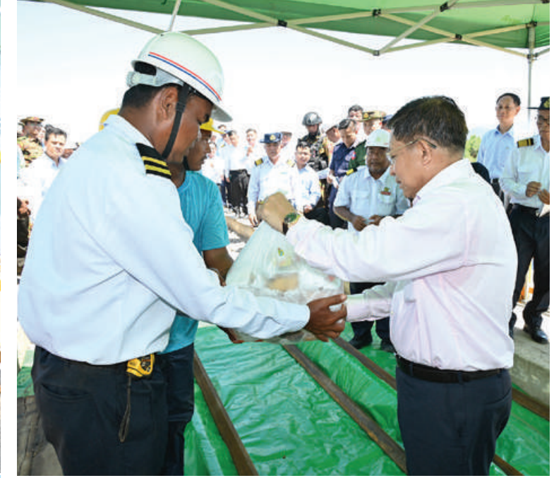
နိုင်ငံတော်စီမံအုပ်ချုပ်ရေးကောင်စီဥက္ကဋ္ဌ နိုင်ငံတော်ဝန်ကြီးချုပ် ဗိုလ်ချုပ်မှူးကြီး မင်းအောင်လှိုင်အား ရန်ကုန်-မန္တလေး လမ်းပိုင်းနှင့် သာစည်-ရွှေညောင်-တောင်ကြီးလမ်းပိုင်း ရထားလမ်းရေတိုက်စားမှုကြောင့် ထိခိုက်ပျက်စီးခဲ့မှုများနှင့် လမ်းပိုင်း ပြန်လည်ဖွင့်လှစ်နိုင်ရေးဆောင်ရွက်သွားမည့်အခြေအနေများကို တာဝန်ရှိသူတစ်ဦးက ရှင်းလင်းတင်ပြစဉ်။