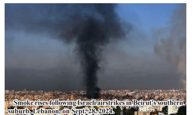
Smoke rises following Israeli airstrikes in Beirut's southern suburb, Lebanon, on Sept. 28, 2024.

grabbed international headlines, was followed by Israel's largest military operation in Lebanon since 2006, with bombings in Dahieh and regions in southern and eastern Lebanon, leading to more casualties. Analysts believe that Nasrallah's death could create a power vacuum within Hezbollah, destabilizing Lebanon and adding uncertainty to the broader regional conflict, while altering strategic dynamics in the Middle East. According to the Israeli military, Friday's airstrikes killed Nasrallah, alongside other Hezbollah commanders, which