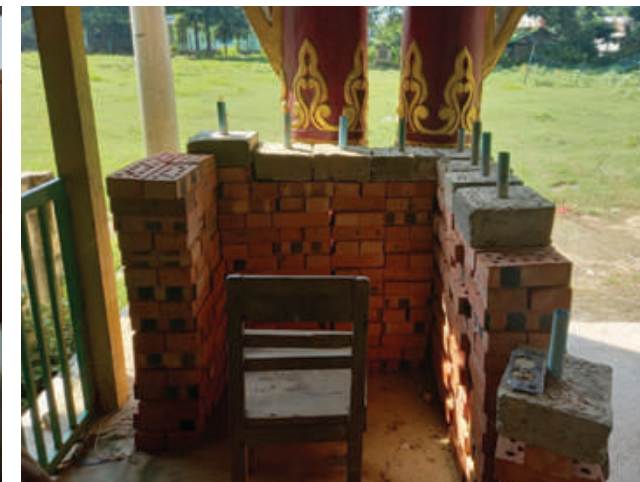
မတ္တရာမြို့နယ် သုံးဆယ်ပေးကျေးရွာအတွင်းရှိ လူနေအိမ်များကို အကာအကွယ်ရယူ၍ အကြမ်းဖက်သမားများအသုံးပြုခဲ့သည့် သဲအိတ် ဘန်ကာများကို တွေ့ရစဉ်။