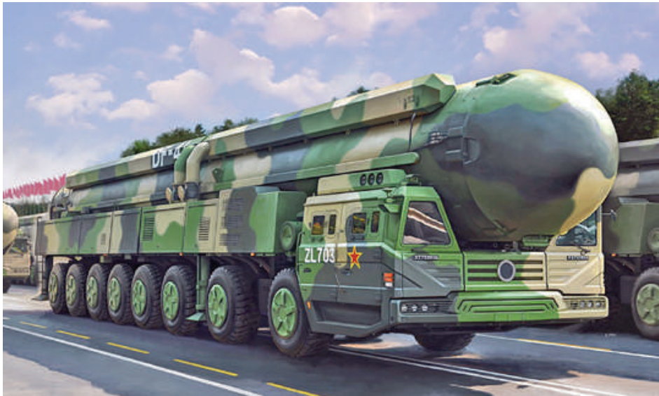
တရုတ်နိုင်ငံ၏ Dong Feng (DF)-41 ICBM ကို တွေ့ရစဉ်။

အဆိုပါပစ်ခတ်စမ်းသပ်မှုသည် ကျယ်ပြန့်သည့် ခွဲကျည်စမ်းသပ်မှုနှင့် စစ်ရေးလေ့ကျင့်မှုတို့၏ တစ်စိတ်တစ်ဒေသဖြစ်ပြီး အာရှ-ပစိဖိတ်ဒေသတွင် ပိုမိုတိုးမြှင့်လုပ်ဆောင်လာခြင်းဖြစ်သည်။ ဆိုရလျှင် အင်ဒို-ပစိဖိတ်ဒေသတွင် စစ်ရေးဖြန့်ကြက်မှု မြင့်တက်လာသော အမေရိကန်နှင့် တင်းမာမှုများ မြင့်တက်နေသည့်အချိန်တွင် ခွဲကျည်စမ်းသပ်မှုများ ပေါ်ထွက်လာခြင်းဖြစ်သည်။ ပင်တဂွန်၏နောက်ဆုံး ဆန်းစစ်အကဲဖြတ်ချက်၌ PLARF သည် မဟာဗျူဟာ မြောက်ဟန့်တားမှုစွမ်းဆောင်ရည်များ မြင့်တင်နိုင်