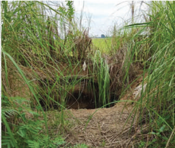
မတ္တရာမြို့နယ် သုံးဆယ်ပေးကျေးရွာအတွင်း၌ အကြမ်းဖက်သမားများအသုံးပြုခဲ့သည့် ဆက်သွယ်ရေးမြောင်းနှင့် ပစ်ကျင်း များကို တွေ့ရစဉ်။