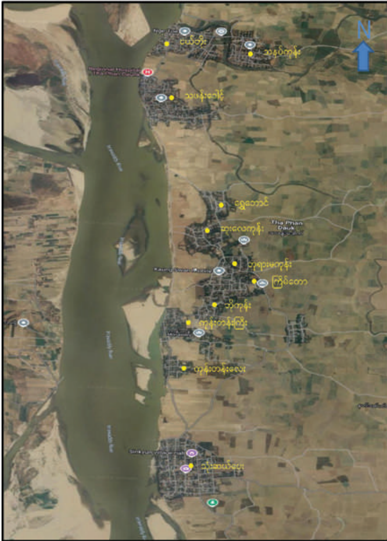
အကြမ်းဖက်သမားများ ခိုအောင်းနေထိုင်လျက်ရှိသည့် ဧရာဝတီမြစ်ကြောင်း တစ်လျှောက်မှ ကျေးရွာများကို တွေ့မြင်ရပုံ။