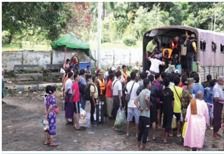
နယ်မြေခံတပ်မတော်သားများက ဒေသခံရေဘေးသင့်ပြည်သူများကို ကူညီ ကယ်ဆယ်ရေးနှင့် ပြန်လည်ထူထောင်ရေးလုပ်ငန်းများ ဆောင်ရွက်ပေးစဉ်။

နေပြည်တော် စက်တင်ဘာ ၂၉ နေပြည်တော်ကောင်စီနယ်မြေ အပါအဝင် တိုင်းဒေသကြီးနှင့် ပြည်နယ်များရှိ ရေကြီးရေလျှံမှုဖြစ်ပေါ်ခဲ့သည့် ရပ်ကွက်၊ ကျေးရွာများတွင် ကူညီကယ်ဆယ်ရေး လုပ်ငန်းများနှင့် ပြန်လည်ထူထောင်ရေး လုပ်ငန်းများကို အင်တိုက်အားတိုက် တက်ကြွစွာ ပူးပေါင်းဆောင်ရွက်ပေး လျက်ရှိရာ ယနေ့တွင်လည်း နေပြည်တော် ကောင်စီနယ်မြေ လယ်ဝေးမြို့နယ် တပ်ကုန်းမြို့နယ် ပျဉ်းမနားမြို့နယ်နှင့် ပုဗ္ဗသီရိမြို့နယ်တို့တွင် လည်းကောင်း၊ ကယားပြည်နယ်၊ လွိုင်ကော်မြို့တို့တွင် လည်းကောင်း ဘုန်းတော်ကြီးကျောင်း များ၊ စာသင်ကျောင်းများ၊ ဆေးရုံဆေးခန်း များ၊ ဌာနဆိုင်ရာအဆောက်အအုံများတွင် လိုအပ်သည်များ ကူညီရွှေ့ပြောင်းပေးခြင်း နှင့် သန့်ရှင်းရေးလုပ်ငန်းများဆောင်ရွက်