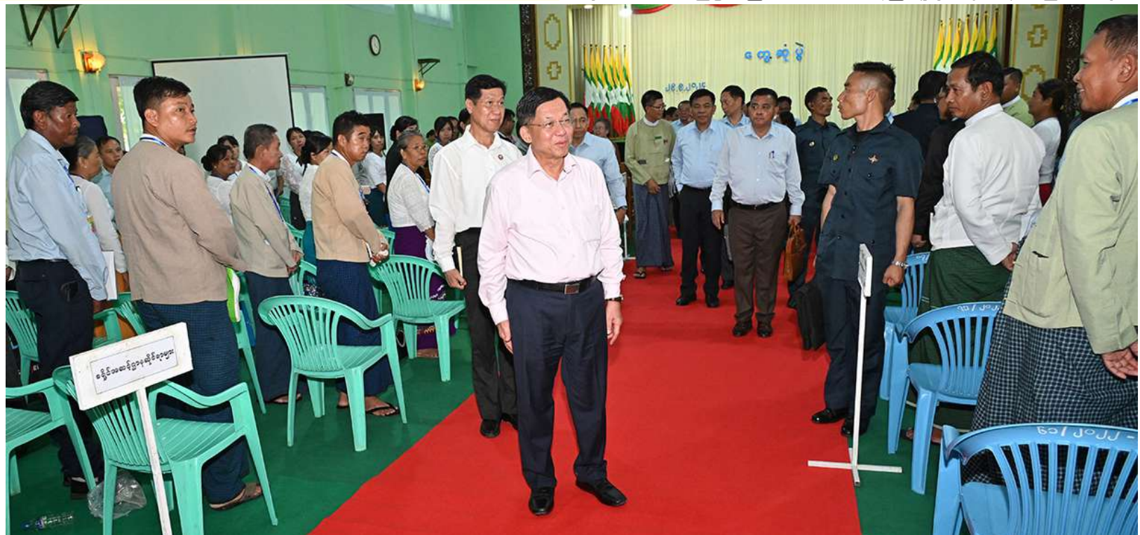
နိုင်ငံတော်စီမံအုပ်ချုပ်ရေးကောင်စီဥက္ကဋ္ဌ နိုင်ငံတော်ဝန်ကြီးချုပ် ဗိုလ်ချုပ်မှူးကြီးမင်းအောင်လှိုင် မိတ္ထီလာခရိုင်အတွင်းရှိ ဌာနဆိုင်ရာတာဝန်ရှိသူများ၊ မြို့မိမြို့ဖများကို ရင်းရင်းနှီးနှီးလိုက်လံနှုတ်ဆက်စဉ်။

မိမိတို့နိုင်ငံတွင် စိုက်ပျိုးရေးနှင့် ပတ်သက်၍ မိရိုးဖလာစိုက်ပျိုးခြင်းများကို ဆောင်ရွက်လျက်ရှိပြီး မိတ္ထီလာခရိုင်အတွင်း ဆန်ဖူလုံမှုအနေဖြင့် နည်းပါးနေသေးသည်ကို တွေ့ရှိရကြောင်း၊ တစ်ဧကချင်းအထွက်နှုန်းများ ပန်းတိုင်ရည်မှန်းချက်ပြည့်မီစေရေး ဆောင်ရွက်သွားရမည်ဖြစ်ကြောင်း၊ ဒေသအတွင်း စိုက်ပျိုးသမျှအကျိုးကို ခံစားနိုင်ရန်