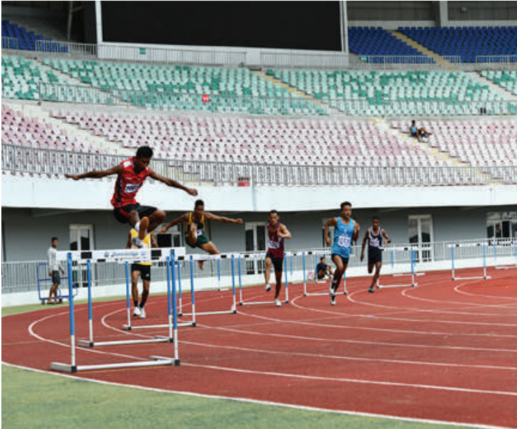
တပ်မတော်(ကြည်း၊ ရေ၊ လေ) အားကစားပြိုင်ပွဲများတွင် အားကစားသမားများ ယှဉ်ပြိုင်နေမှုကို တွေ့ရစဉ်။

နေပြည်တော် စက်တင်ဘာ ၂၉ ၂၀၂၄ ခုနှစ် တပ်မတော်(ကြည်း၊ ရေ၊ လေ) အားကစားပြိုင်ပွဲများကို ယနေ့ နံနက်ပိုင်းတွင် သက်ဆိုင်ရာ အားကစားနည်းများအလိုက် သတ်မှတ်ထားသော အားကစားကွင်း၊ ရုံများတွင် ဆက်လက် ယှဉ်ပြိုင်ကစားကြသည်။ ၂၀၂၄ ခုနှစ် တပ်မတော်(ကြည်း၊ ရေ၊ လေ)အားကစားပြိုင်ပွဲများမှ တပ်မတော် ကာကွယ်ရေးဦးစီးချုပ်ခိုင်း တပ်မတော် (ကြည်း၊ ရေ၊ လေ) ပြေးခုန်ပစ်ပြိုင်ပွဲကို ဇေယျာသီရိတပ်မတော်အားကစားကွင်း၌ အမျိုးသား၊ အမျိုးသမီး ကီလိုမီတာ၂၀ လမ်းလျှောက်ပြိုင်ပွဲ ဖိုလ်လုပွဲ၊ အမျိုးသား ၁၀ မျိုးစုံ မီတာ ၁၀၀ ပြေးပြိုင်ပွဲ ဖိုလ်လုပွဲ၊ အမျိုးသား၊ အမျိုးသမီး မီတာ ၄၀၀ တန်း