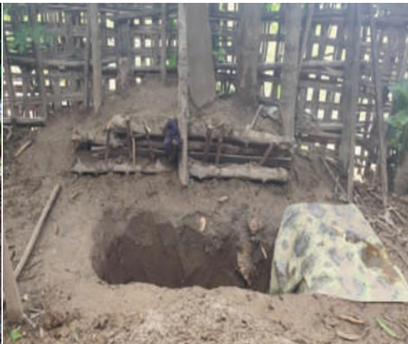
ဧရာဝတီမြစ်ကြောင်းတစ်လျှောက်ရှိ ကျေးရွာများတွင် အကြမ်းဖက်သမားများ အသုံးပြုထားသည့် ဆက်သွယ်ရေးမြောင်းနှင့် ပစ်ကျင်းကို တွေ့ရစဉ်။

ထိုသို့ PDF အမည်ခံအကြမ်းဖက်သမား များ၏ လူမဆန်သည့်လုပ်ရပ်များကို လက်မခံနိုင်တော့သည့် ဒေသခံပြည်သူ များက မတ္တရာမြို့နယ်အတွင်း ဧရာဝတီ မြစ်ကြောင်းတစ်လျှောက်ရှိ ကျေးရွာများ တွင် PDF အမည်ခံအကြမ်းဖက်သမား များ ခိုအောင်းနေထိုင်ကြောင်းနှင့် ၎င်းတို့ လှုပ်ရှားသွားလာနေမှုများကို တပ်မတော် စစ်ကြောင်းများသို့ လျှို့ဝှက်စွာဆက်သွယ် သတင်းပေးပို့လာသဖြင့် လုံခြုံရေးတပ်ဖွဲ့ဝင် များက လိုအပ်သည့်အကြမ်းဖက်ချေမှုန်းရေး စစ်ဆင်ရေးကို စက်တင်ဘာ ၂၀ ရက်မှစတင်