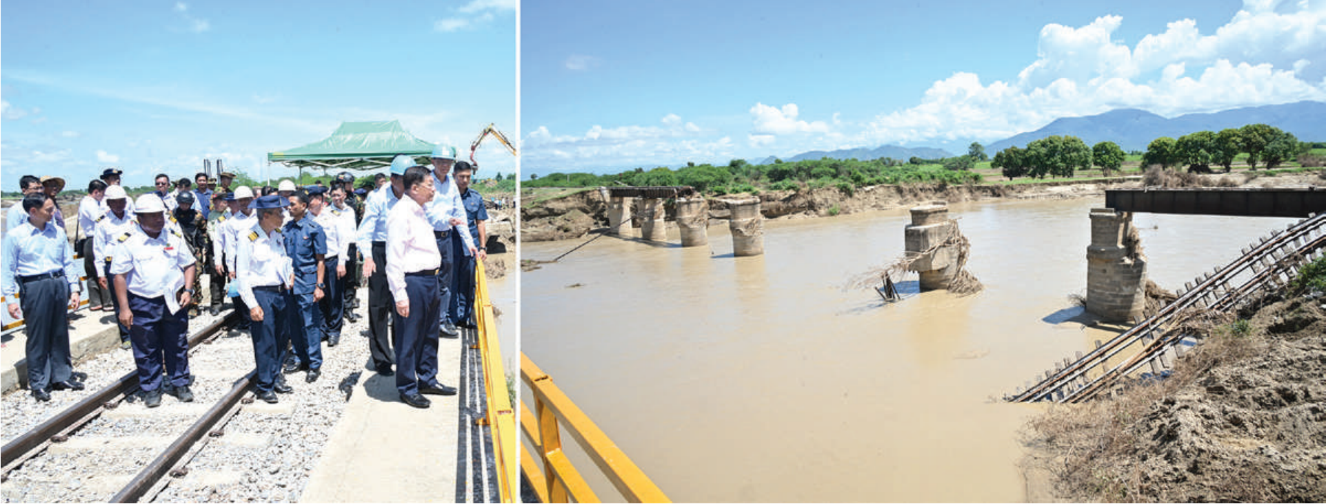
နိုင်ငံတော်စီမံအုပ်ချုပ်ရေးကောင်စီဥက္ကဋ္ဌ နိုင်ငံတော်ဝန်ကြီးချုပ် ဗိုလ်ချုပ်မှူးကြီးမင်းအောင်လှိုင် ရေကြီးရေလျှံမှုကြောင့် ထိခိုက်ပျက်စီးမှုများဖြစ်ပေါ်ခဲ့သည့် သာစည်-မန္တလေးမီးရထားလမ်းပိုင်းပေါ်ရှိ စမုံချောင်းတံတားပျက်စီးမှုအခြေအနေများကို ကြည့်ရှုစစ်ဆေးစဉ်။