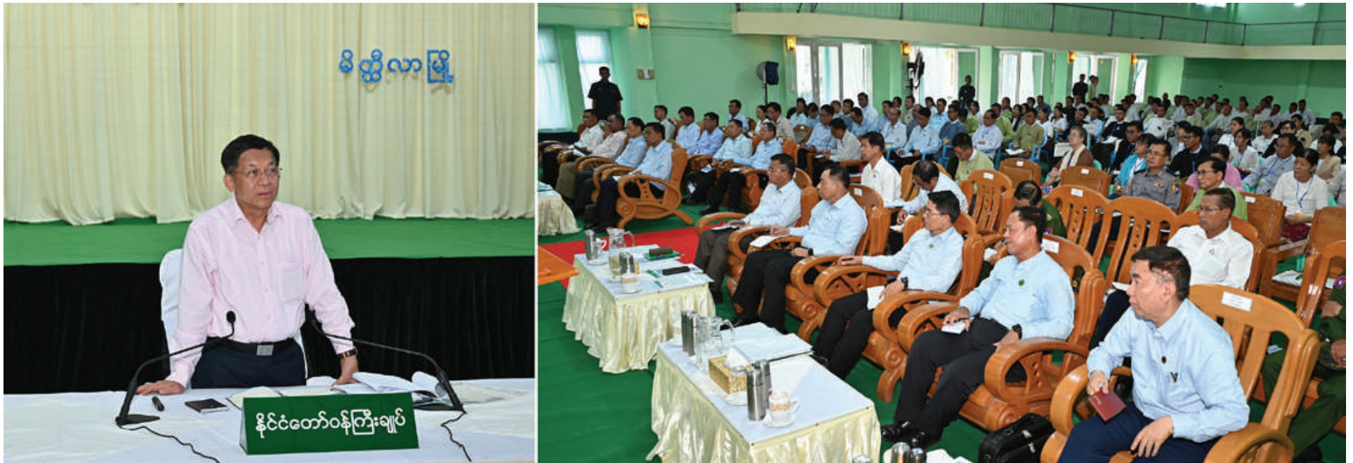
နိုင်ငံတော်စီမံအုပ်ချုပ်ရေးကောင်စီဥက္ကဋ္ဌ နိုင်ငံတော်ဝန်ကြီးချုပ် ဗိုလ်ချုပ်မှူးကြီးမင်းအောင်လှိုင် မိတ္ထီလာခရိုင်အတွင်းရှိ ဌာနဆိုင်ရာတာဝန်ရှိသူများ၊ မြို့မိမြို့ဖများကို တွေ့ဆုံ၍ ဒေသစီးပွားဖွံ့ဖြိုးတိုးတက်ရေးဆိုင်ရာများ ဆွေးနွေးပြောကြားစဉ်။

မိတ္ထီလာဒေသ၏ အခြေခံကောင်းများကို အကျိုးရှိရှိအသုံးချ၍ ဖွံ့ဖြိုးတိုးတက်သည့် စံပြဒေသတစ်ခုဖြစ်စေရေး အတူတကွဝိုင်းဝန်းကြိုးပမ်းဆောင်ရွက်ကြရမည်