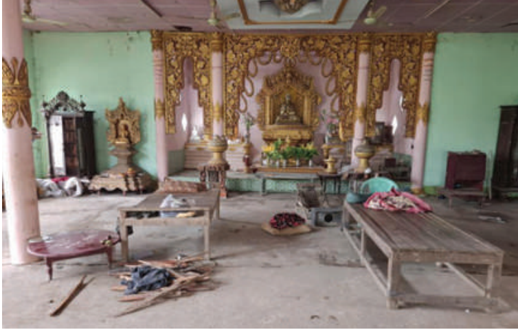
မတ္တရာမြို့နယ် သုံးဆယ်ပေးကျေးရွာအတွင်းရှိ ဘုန်းတော်ကြီးကျောင်း၌ အကြမ်းဖက် သမားများ နေထိုင်အသုံးပြုခဲ့သည့် အသုံးအဆောင်ပစ္စည်းများကို တွေ့ရစဉ်။

နေပြည်တော် စက်တင်ဘာ ၂၉ ဧရာဝတီမြစ်ကြောင်းအတွင်း ခရီးသွား ပြည်သူလူထုက ခရီးသွားလာခြင်းနှင့် ကုန်စည်ပို့ဆောင်ခြင်းများ ဆောင်ရွက် နေသည့် သင်္ဘောများကို PDF အမည်ခံ အကြမ်းဖက်သမားများက ကုန်စည် စီးဆင်းမှုပြတ်တောက်စေရန်နှင့် ၎င်းတို့ အတွက် ငွေကြေးမလုံလောက်မှုများ ဖြစ်ပေါ်လာသည့်အတွက် ဆက်ကြေး တောင်းခြင်း၊ ဆက်ကြေးမပေးနိုင်သည့် သင်္ဘောများကို ခေါင်းစဉ်အမျိုးမျိုးတပ်၍ လက်နက်ကြီး၊ လက်နက်ငယ်များဖြင့် ပစ်ခတ်တိုက်ခိုက်ခြင်းများ ပြုလုပ်လျက် ရှိသည်။