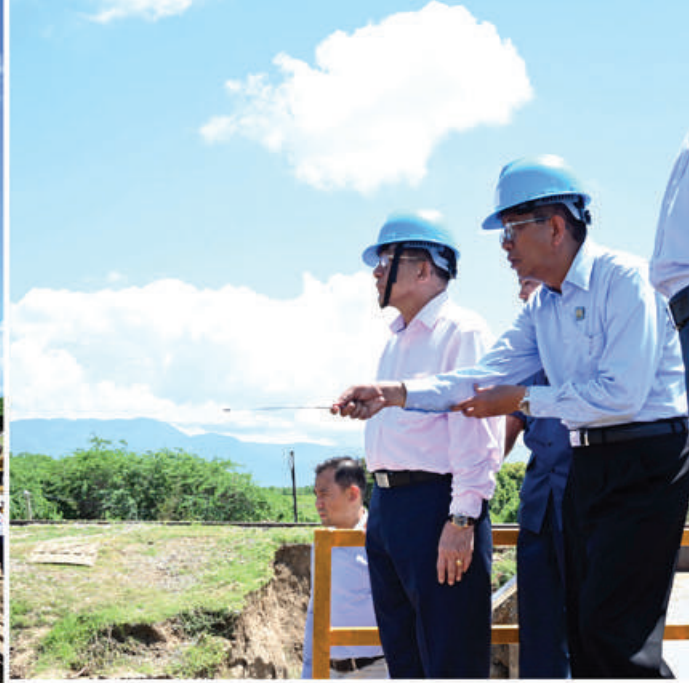
Senior General Min Aung Hlaing inspects construction of Samon Bridge.