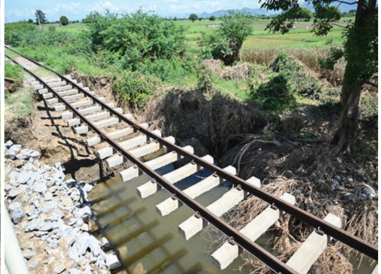
နိုင်ငံတော်စီမံအုပ်ချုပ်ရေးကောင်စီဥက္ကဋ္ဌ နိုင်ငံတော်ဝန်ကြီးချုပ် ဗိုလ်ချုပ်မှူးကြီးမင်းအောင်လှိုင် မီးရထားလမ်းတစ်လျှောက် စိုက်ပျိုးရေးလုပ်ငန်းကောင်းမွန်စွာအောင်မြင်ဖြစ်ထွန်းမှုအခြေအနေများ၊ ရေကြီးရေလျှံမှု ဖြစ်ပေါ်စဉ် ရေအလုံးအရင်းဖြင့် ဝင်ရောက်တိုက်စားမှုများကြောင့် စိုက်ကေများနှင့် မီးရထားလမ်းပိုင်းတစ်လျှောက် အချို့နေရာများတွင် ထိခိုက်ပျက်စီးနေမှုအခြေအနေများကို ကြည့်ရှုစစ်ဆေးစဉ်။

ကြောင့် စိုက်ကေများနှင့် မီးရထားလမ်း ပိုင်းတစ်လျှောက် အချို့နေရာများတွင် ထိခိုက်ပျက်စီးနေမှု အခြေအနေများကို ကြည့်ရှုစစ်ဆေးကာ တာဝန်ရှိသူများအား လိုအပ်သည်များ မှာကြားသည်။ ယင်းနောက် နိုင်ငံတော်စီမံအုပ်ချုပ် ရေးကောင်စီဥက္ကဋ္ဌ နိုင်ငံတော်ဝန်ကြီးချုပ် နှင့် အဖွဲ့ဝင်များသည် ရေကြီးရေလျှံမှုဖြစ် ပေါ်စဉ် ရေအလုံးအရင်းဖြင့် မြင့်တက် တိုက်စားခဲ့မှုကြောင့် တံတားအမှတ် ၆၉၁ (အဆန်)၏ ရန်ကုန်ဘက်ခြမ်းတံတားချဉ်း ကပ်တာပေါင် ရေတိုက်စားပျက်စီးခဲ့မှုကို ရထားလမ်းဖြတ်သိမ်း၍ စက်ယာဉ်