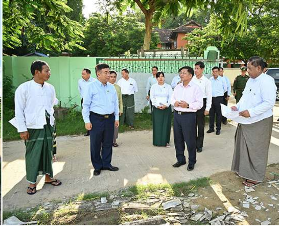
နိုင်ငံတော်စီမံအုပ်ချုပ်ရေးကောင်စီဥက္ကဋ္ဌ နိုင်ငံတော်ဝန်ကြီးချုပ် ဗိုလ်ချုပ်မှူးကြီးမင်းအောင်လှိုင် မိတ္ထီလာမြို့၌ ကျောင်းသားစုပေါင်းခန်းမဆောက်လုပ်မည့် လျာထားမြေနေရာကို ကြည့်ရှုစဉ်။

ကျောပိုးမှအဆက် မန္တလေးတိုင်းဒေသကြီး ဝန်ကြီးချုပ် ဦးမျိုးအောင်၊ ကာကွယ်ရေးဦးစီးချုပ်ရုံး (ကြည်း)မှ အဆင့်မြင့်တပ်မတော်အရာရှိကြီးများ၊ မန္တလေးတိုင်းဒေသကြီးအစိုးရအဖွဲ့ဝင်များ၊ မိတ္ထီလာခရိုင်အတွင်းရှိ ခရိုင်နှင့်မြို့နယ်အဆင့် ဌာနဆိုင်ရာတာဝန်ရှိသူများ၊ အုပ်ချုပ်ရေးမှူးများ၊ မြို့မိမြို့ဖများတက်ရောက်ကြသည်။