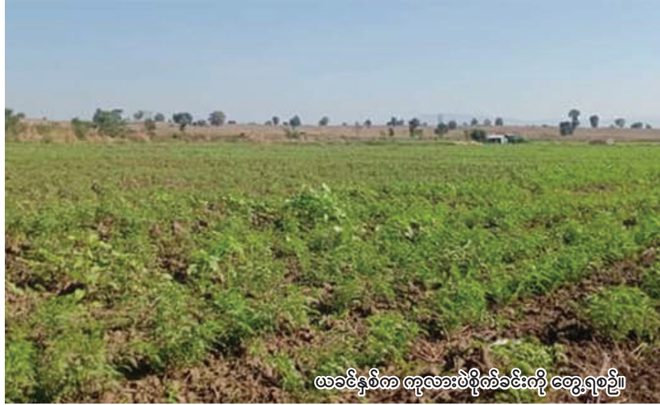
ယခင်နှစ်က ကုလားပဲစိုက်ခင်းကို တွေ့ရစဉ်။

ရွှေဘို စက်တင်ဘာ ၂၉ ရက်နေ့တွင် ယခုနှစ် ဆောင်းသီးနှံ စိုက်ပျိုးရာသီ၌ ကုလားပဲ ၆၂၀၂၉ ဧက စိုက်ပျိုးမည်ဖြစ်ကြောင်း ရွှေဘိုခရိုင် စိုက်ပျိုးရေးဦးစီးဌာနမှ သိရသည်။