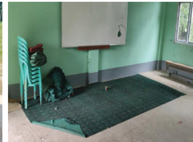
ဧရာဝတီမြစ်ကြောင်းတစ်လျှောက်ရှိ ကျေးရွာများမှ စာသင်ကျောင်း များ၌ အကြမ်းဖက်သမားများ နေထိုင်အသုံးပြုထားသည့် အသုံးအဆောင် ပစ္စည်းများကို တွေ့ရစဉ်။