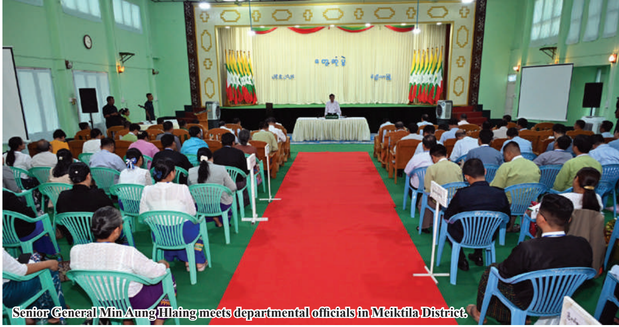
Senior General Min Aung Hlaing meets departmental officials in Meiktila District.