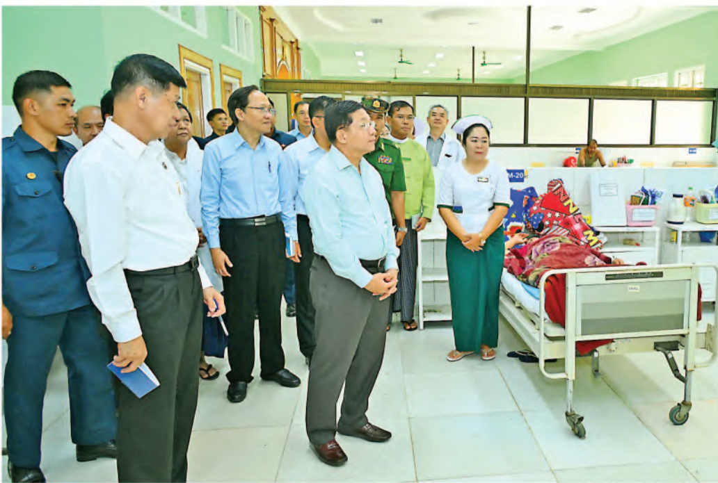
Senior General Min Aung Hlaing inspects a hospital ward which has been repaired.