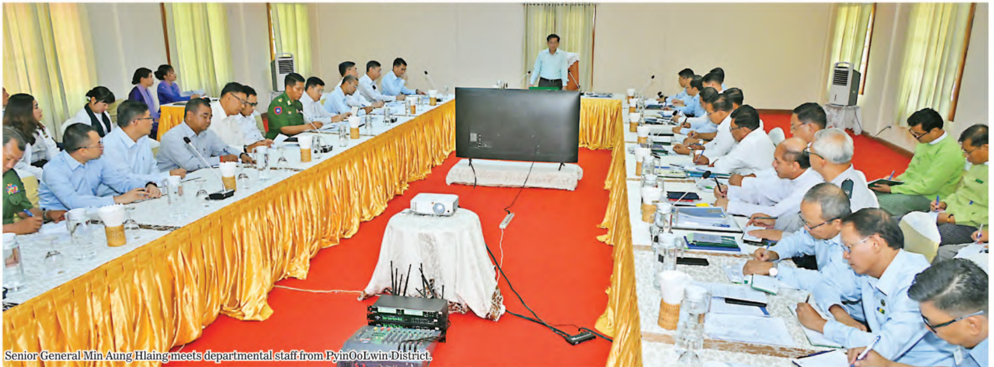
Senior General Min Aung Hlaing meets departmental staff from PyinOoLwin District.

Chairman of State Administration Council Prime Minister Senior General Min Aung Hlaing met departmental personnel of PyinOoLwin township and district at the meeting hall of National Landmark Gardens in PyinOoLwin in Mandalay Region this morning, and discussed beautifying and development of PyinOoLwin and extension of coffee sown acreage.