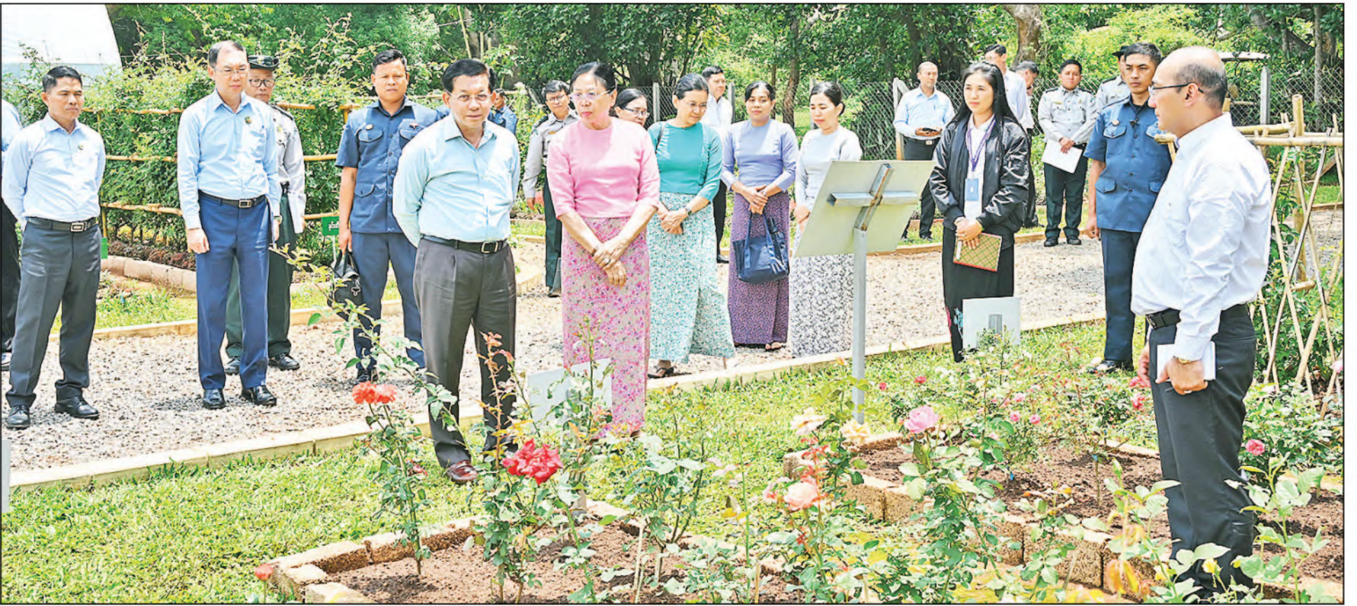
နိုင်ငံတော်စီမံအုပ်ချုပ်ရေးကောင်စီဥက္ကဋ္ဌ နိုင်ငံတော်ဝန်ကြီးချုပ် ဗိုလ်ချုပ်မှူးကြီးမင်းအောင်လှိုင်နှင့်ဇနီး ဒေါ်ကြူကြူလှ အမျိုးသားကန်တော်ကြီးဥယျာဉ်အတွင်း လှည့်လည်ကြည့်ရှုစစ်ဆေးစဉ်။

နေပြည်တော် မေ ၃၀ ဒေသကြီး၊ ပြင်ဦးလွင်ခရိုင်နှင့် မြို့နယ်အတွင်းရှိ ဌာနဆိုင်ရာဝန်ထမ်းများ ကော်ဖီတိုးချဲ့စိုက်ပျိုးနိုင်ရေးဆိုင်ရာကိစ္စရပ်များကို ဆွေးနွေးမှာကြားသည်။ နိုင်ငံတော်စီမံအုပ်ချုပ်ရေးကောင်စီဥက္ကဋ္ဌ နိုင်ငံတော် အဆိုပါ တွေ့ဆုံပွဲသို့ နိုင်ငံတော်စီမံအုပ်ချုပ်ရေးကောင်စီဥက္ကဋ္ဌ နိုင်ငံတော် ဝန်ကြီးချုပ်နှင့်အတူ စာမျက်နှာ ၁၆ ကော်လံ ၁ ✽ ဗိုလ်ချုပ်မှူးကြီးမင်းအောင်လှိုင်သည် ယနေ့နံနက်ပိုင်းတွင် မန္တလေးတိုင်း အား ပြင်ဦးလွင်မြို့၊ အမျိုးသားအထိမ်းအမှတ်ဥယျာဉ်ရှိ အစည်းအဝေး ခန်းမ၌တွေ့ဆုံ၍ ပြင်ဦးလွင်မြို့၊ သာယာလှပရေး၊ ဖွံ့ဖြိုးတိုးတက်ရေးနှင့် ဝန်ကြီးချုပ်နှင့်အတူ