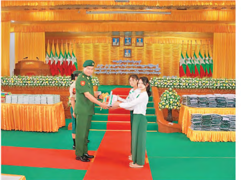
အရှေ့မြောက်တိုင်းစစ်ဌာနချုပ် တိုင်းမှူး ဗိုလ်ချုပ်စိုးတင် ကျောင်းသား၊ ကျောင်းသူများအတွက် ကျောင်းဝတ်စုံနှင့်စာရေးကိရိယာများပေးအပ်စဉ်။