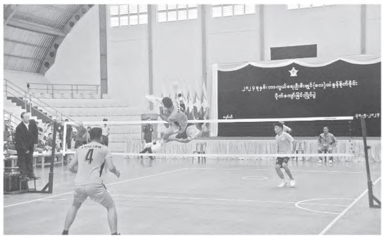
၂၀၂၄ ခုနှစ် ကာကွယ်ရေးဦးစီးချုပ်(လေ) တံခွန်စိုက်ခိုင်း ပိုက်ကျော်ခြင်းပြိုင်ပွဲဖွင့်ပွဲတွင် ပြိုင်ပွဲဝင်အသင်းများ၏ယှဉ်ပြိုင်ကစားနေမှုကို တွေ့ရစဉ်။

၂၀၂၄ ခုနှစ်၊ ကာကွယ်ရေးဦးစီးချုပ် (လေ) တံခွန်စိုက်ခိုင်း ပိုက်ကျော်ခြင်းပြိုင်ပွဲ ဖွင့်ပွဲကို ယနေ့နံနက်ပိုင်းတွင် မော်ဘီလေတပ် စခန်း အားကစားခန်းမ၌ ကျင်းပပြုလုပ်ရာ တပ်မတော်(လေ)မှ အရာရှိကြီးများ၊ အရာရှိ၊ စစ်သည်၊ မိသားစုများ၊ မြန်မာနိုင်ငံ ခြင်းလုံးအဖွဲ့ချုပ်မှတာဝန်ရှိသူများ၊ ပြိုင်ပွဲဝင် အားကစားသမားများနှင့် အားကစား ဝါသနာရှင်များ တက်ရောက်ကြပြီး ကာကွယ်ရေးဦးစီးချုပ်(လေ) ကိုယ်စား ဗိုလ်မှူးချုပ်ကျော်သက်နိုင်က သင်တန်းဖွင့် မိန့်ခွန်းပြောကြားသည်။