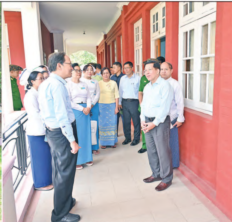
နိုင်ငံတော်စီမံအုပ်ချုပ်ရေးကောင်စီဥက္ကဋ္ဌ နိုင်ငံတော်ဝန်ကြီးချုပ် ဗိုလ်ချုပ်မှူးကြီးမင်းအောင်လှိုင် ပြင်ဦးလွင်မြို့၊ အထွေထွေရောဂါကုပြည်သူ့ဆေးရုံကြီးအတွင်း လှည့်လည်ကြည့်ရှုစစ်ဆေးစဉ်။