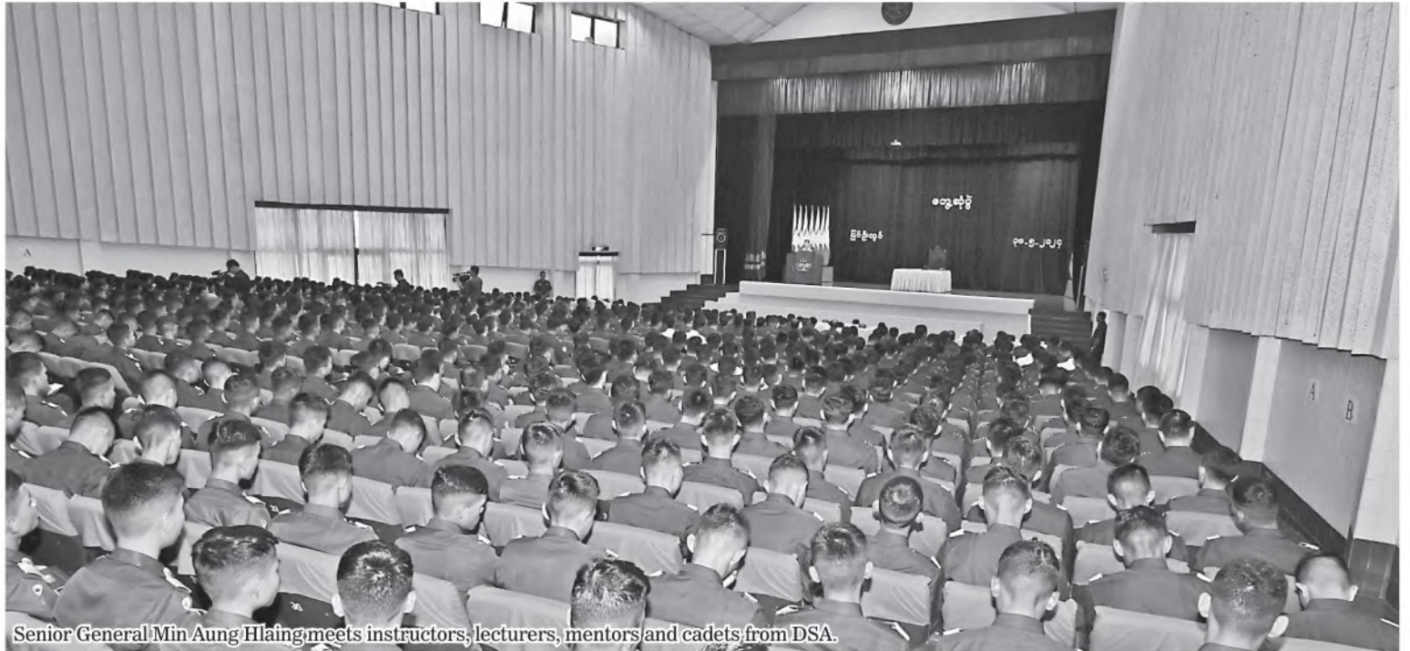
Senior General Min Aung Hlaing meets instructors, lecturers, mentors and cadets from DSA.

First, the Senior General explained that occurrences of voting frauds in the 2020 multi-party democracy general election, political declaration of the State of emergency and serving State responsibilities by Tatmadaw due to lack of solving voting frauds, difficulties in outbreak of COVID-19 at a time the State Administration Council has been serving State responsibilities, armed terror acts and subversive acts of those unwilling to see peace and stability of the State showing political condition, participation of some service personnel in CDM movements due to instigations, and endeavours of the State to develop overall development of political, economic and social sectors aid various difficulties and efforts to forge peace