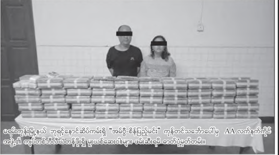
မရမ်းကုန်းမြို့နယ် ဘုရင့်နောင်ဆိပ်ကမ်းရှိ “အမိဗွီ-စိန်ပြည့်မင်း” ကုန်တင်သင်္ဘောပေါ်မှ AA လက်နက်ကိုင်အဖွဲ့၏ ချစ်တစ်ဘီလီယံတန်ဖိုးရှိ မူးယစ်ဆေးဝါးများ ဖမ်းဆီးရမိ ဓာတ်ပုံမှတ်တမ်း။