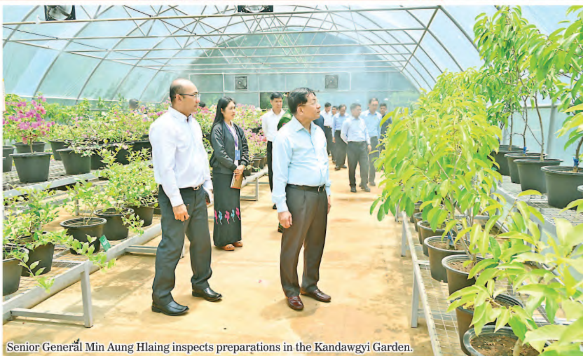
Senior General Min Aung Hlaing inspects preparations in the Kandawgyi Garden.