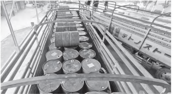
မန္တလေးတိုင်းဒေသကြီး၌ ဖမ်းဆီးရမိမှု။

တရားမဝင်ကုန်သွယ်မှုတိုက်ဖျက်ရေး ဦးဆောင်ကော်မတီ၏ ကြီးကြပ်ကွပ်ကဲမှုဖြင့် တရားမဝင်ကုန်သွယ်မှုများကို ဥပဒေနှင့်အညီ ထိရောက်စွာ တားဆီးအရေးယူနိုင်ရေး ဆောင်ရွက်လျက်ရှိရာ မေလ ၂၅ ရက်တွင် အကောက်ခွန်ဦးစီးဌာန၏ စီမံခန့်ခွဲမှုဖြင့် တာဝန်ကျပေါင်းအဖွဲ့များက စစ်ဆေးမှုများ ဆောင်ရွက်ရာတွင် အေးရှားဝေါလ်ကုန် သေတ္တာစစ်ဆေးရေးစခန်း၌ ကုန်သေတ္တာ(၁) လုံးအတွင်းမှ သွင်းကုန်လိုင်စင်တင်ပြနိုင် ခြင်းမရှိသည့် တရုတ်နိုင်ငံထုတ် Carbon Stick ကီလိုဂရမ် (၁၈၀၀) အပါအဝင် ကုန်ပစ္စည်း(၂)မျိုး (ခန့်မှန်းတန်ဖိုးငွေကျပ် ၁၆၁၅၈၀၀)ကိုဖမ်းဆီးရမိခဲ့ပြီး အကောက် ခွန်လုပ်ထုံးလုပ်နည်းများနှင့်အညီ အရေးယူ ဆောင်ရွက်လျက်ရှိသည်။ ထို့ပြင် ရန်ကုန်တိုင်းဒေသကြီးတရား မဝင်ကုန်သွယ်မှုတိုက်ဖျက်ရေးအဖွဲ့၏ စီမံခန့်ခွဲမှုဖြင့် တာဝန်ကျပေါင်းအဖွဲ့ များက စစ်ဆေးမှုများဆောင်ရွက်ခဲ့ရာ မေလ ၂၇ ရက်တွင် ကုန်းတွင်းဆိပ်ကမ်း ရွာသာကြီး Dry Port ၌ Bonded Warehouse အတွင်းမှ ကုမ္ပဏီမှ စွန့်လွှတ် ကြောင်းလျှောက်ထားလာသည့် ဗီယက်နမ်