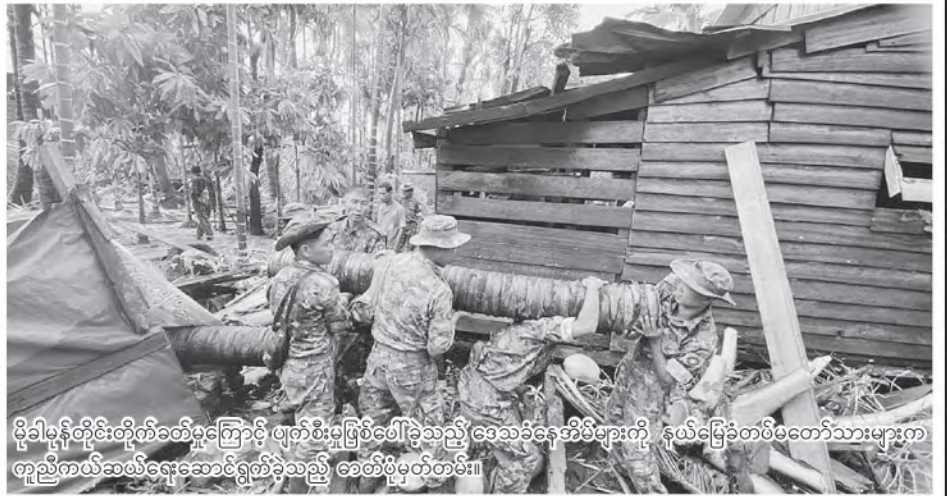
မိုခါမုန်တိုင်းတိုက်ခတ်မှုကြောင့် ပျက်စီးမှုဖြစ်ပေါ်ခဲ့သည့် ဒေသခံနေအိမ်များကို နယ်မြေခံတပ်မတော်သားများက တူညီကယ်ဆယ်ရေးဆောင်ရွက်ခဲ့သည့် ဓေတီဖုံမှတ်တမ်း။

မိုခါကြောင့် ရခိုင်ပြည်နယ် မြို့နယ် ၁၇ မြို့နယ်ရှိ သာသနိကအဆောက်အအုံ အများအပြားပျက်စီးမှုရှိ ခဲ့ပြီး ကျောင်းပေါင်း ၁၅၀၀၊ စေတီပေါင်း အဆူ ၂၃၀၊ သိမ်အလုံး ၆၄၀၊ ကျောင်းဆောင် ၁၇၈၇ ဆောင်၊ ဓမ္မာရုံ ၈၃၈ လုံး၊ ဆွမ်းစားဆောင် ၄၅၈ လုံး၊ ကုဋိ ၁၀၂၆ လုံးတို့ ချို့ယွင်းပျက်စီးခဲ့သည်ကို တွေ့ရှိရ သည်။ အဆိုပါ ပျက်စီးဆုံးရှုံးမှုများကို ပြန်လည် ထူထောင်ရေးလုပ်ငန်းများ လျင်မြန်စွာ ဆောင်ရွက်နိုင် ရန်အတွက် ပြည်တွင်း၊ ပြည်ပအလှူရှင်တို့၏ထောက်ပံ့ မှုများ၊ နိုင်ငံတော်အစိုးရ၏ ဘဏ္ဍာငွေများကို အသုံးပြု၍ တပ်မတော်(ရေ)မှ တပ်ဖွဲ့တင်ရေယာဉ်(ချင်းတွင်း)၊ စစ်ရေယာဉ်(မုတ္တမ)၊ စစ်ရေယာဉ်(ပြည်တော်အေး-၂)၊ ကမ်းထိုးရေယာဉ် (၁၇၀၁)၊ (၁၇၂၂)၊ တင့်ကားတင် ကမ်းထိုးယာဉ် (၁၆၁၃)၊ (၁၆၁၄)နှင့်တပ်မတော်(လေ) မှ သယ်ယူပို့ဆောင်ရေးလေယာဉ်များ အသုံးပြု၍