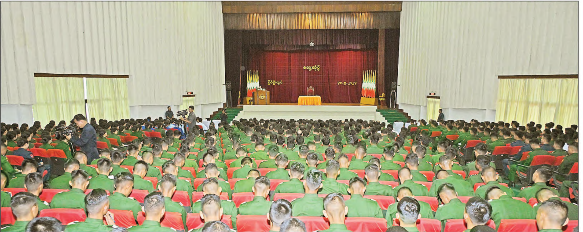
နိုင်ငံတော်စီမံအုပ်ချုပ်ရေးကောင်စီဥက္ကဋ္ဌ တပ်မတော်ကာကွယ်ရေးဦးစီးချုပ် ဗိုလ်ချုပ်မှူးကြီးမင်းအောင်လှိုင် စစ်တက္ကသိုလ်မှ နည်းပြအရာရှိကြီးများ၊ ကထိကအရာရှိကြီးများ၊ ဆရာကြီး၊ ဆရာမကြီးများ၊ သန္ဓေအရာရှိများ၊ သင်တန်းသား၊ သင်တန်းသူများနှင့် ဗိုလ်လောင်းများအား တွေ့ဆုံအမှာစကားပြောကြားစဉ်။

ကျော့ဖုံးမှအဆက် ဆရာမကြီးများ၊ သန္ဓေအရာရှိများ၊ သင်တန်းသား၊ သင်တန်းသူများနှင့် ဗိုလ်လောင်းများအား စစ်တက္ကသိုလ်၊ ဘွဲ့နှင့် သဘင်ခန်းမ၌ တွေ့ဆုံအမှာစကားပြောကြားစဉ် ထည့်သွင်းပြောကြားသည်။