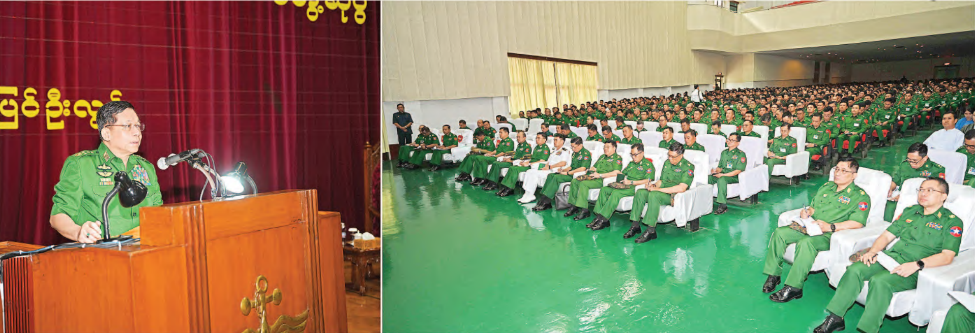
နိုင်ငံတော်စီမံအုပ်ချုပ်ရေးကောင်စီဥက္ကဋ္ဌ တပ်မတော်ကာကွယ်ရေးဦးစီးချုပ် ဗိုလ်ချုပ်မှူးကြီးမင်းအောင်လှိုင် စစ်တက္ကသိုလ်မှ နည်းပြအရာရှိကြီးများ၊ ကထိကအရာရှိကြီးများ၊ ဆရာကြီး၊ ဆရာမကြီးများ၊ သန္ဓေအရာရှိများ၊ သင်တန်းသား၊ သင်တန်းသူများနှင့် ဗိုလ်လောင်းများအား တွေ့ဆုံအမှာစကားပြောကြားစဉ်။

နေပြည်တော် မေ ၃၀ နည်းပြများအနေဖြင့် မိမိတို့တတ်မြောက်သင်ကြားထားသည့် စာပေပညာ၊ စစ်ပညာများကို ဖြတ်သန်းခဲ့ရသည့်အတွက် အကြံပြုချက်များနှင့် ပေါင်းစပ်ချိန်ထိုး၍ စနစ်တကျသင်ကြားလေ့ကျင့်ပေးပြီး စိတ်ဓာတ်ခိုင်မာကောင်းမွန်သည့် နိုင်ငံတော်နှင့်တပ်မတော်က အားထားရသည့် ပြည်သူ့ကားကိုးရသည့် အနာဂတ်ခေါင်းဆောင်များကို မွေးထုတ်ပေးနိုင်ရမည်ဖြစ်သကဲ့သို့ သင်တန်းသားအရာရှိငယ်များ၊ ဗိုလ်လောင်းများအနေဖြင့်လည်း စိတ်ဓာတ်ခံယူချက်ကောင်းစွာဖြင့် သင်ယူလေ့လာ၍ နိုင်ငံတော်နှင့်တပ်မတော်ကို ပြန်လည်အကျိုးပြုနိုင်ရမည်ဖြစ်ကြောင်း နိုင်ငံတော်စီမံအုပ်ချုပ်ရေးကောင်စီဥက္ကဋ္ဌ တပ်မတော်ကာကွယ်ရေးဦးစီးချုပ် ဗိုလ်ချုပ်မှူးကြီးမင်းအောင်လှိုင်က ယနေ့နံနက်ပိုင်းတွင် စစ်တက္ကသိုလ်မှ နည်းပြအရာရှိကြီးများ၊ ကထိကအရာရှိကြီးများ၊ ဆရာကြီး၊ စာမျက်နှာ ၆ ကော်လံ ၁ □