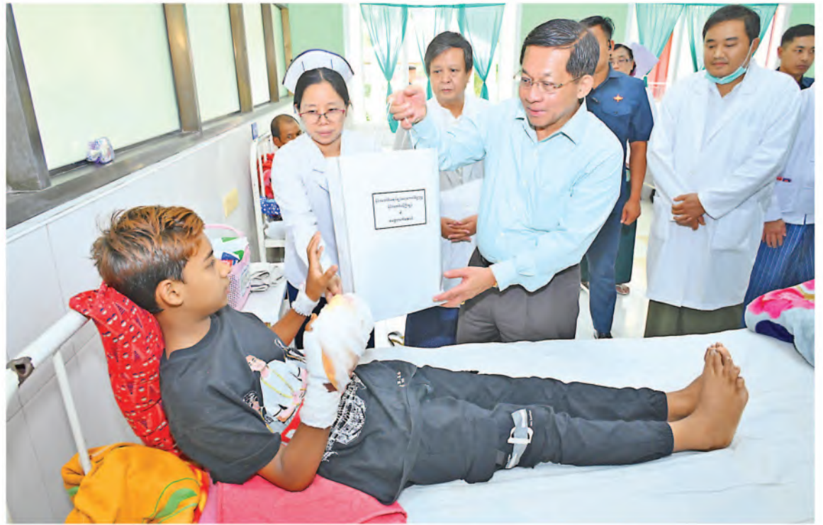
Senior General Min Aung Hlaing presents gift to a patient.

Coffee plan was launched over 20 years ago. Regulation of rules is required in land use. Official supervision is required for the success of coffee plantations. Building of homes on land permitted for coffee has hurt the business.