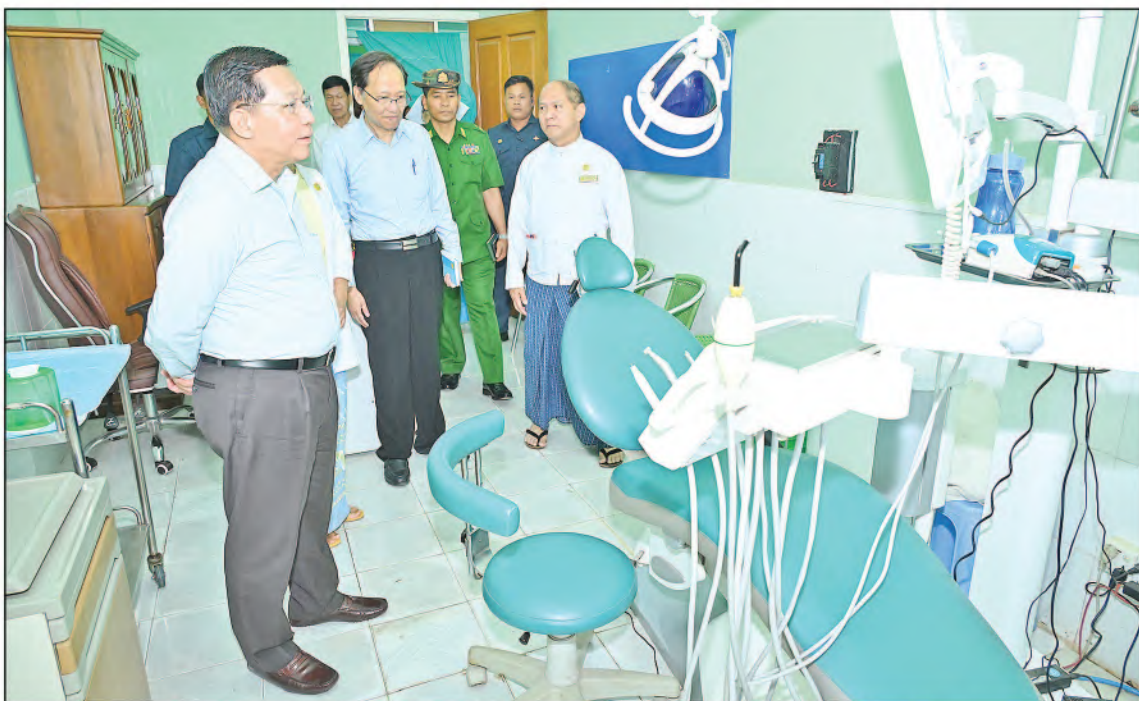
နိုင်ငံတော်စီမံအုပ်ချုပ်ရေးကောင်စီဥက္ကဋ္ဌ နိုင်ငံတော်ဝန်ကြီးချုပ် ဗိုလ်ချုပ်မှူးကြီးမင်းအောင်လှိုင် ပြင်ဦးလွင်မြို့၊ အထွေထွေရောဂါကုပြည်သူ့ဆေးရုံကြီးအတွင်းလှည့်လည်ကြည့်ရှုစစ်ဆေးစဉ်။

★ စာမျက်နှာ ၁၇ မှအဆက် နှစ်လို့ဖွယ်ရာသို့တုရှိပြီးဖြစ်သည့်အတွက် ခရီးသွားမြို့တော်၊ အပန်းဖြေမြို့တော် အပြင် ကျန်းမာရေးစောင့်ရှောက်မှုပေးနိုင် သည့်ကျန်းမာရေးမြို့တော်အသွင်အဖြစ်လည်း အကောင်အထည်ဖော်ဆောင်ရွက်ပေးရမည် ဖြစ်ကြောင်း၊ ပညာရေးနှင့်ပတ်သက်၍ အစဉ် အလာကောင်းရှိသည့် မြို့တစ်မြို့ဖြစ်ပြီး ရာသီဥတုသာယာ၍ အေးချမ်းစွာပညာ သင်ကြားနိုင်ရေးကို အထောက်အကူဖြစ်စေ ၍ ပညာရေးကိုအားပေးမြှင့်တင်ဆောင်ရွက် ပေးရမည်ဖြစ်ကြောင်း၊ ထို့ကြောင့် ပုဂ္ဂလိက ကျောင်းများဖွင့်လှစ်ရာတွင် စည်းကမ်းနှင့်အညီ ဖြစ်ရန်လိုကြောင်း၊ ပုဂ္ဂလိကကျောင်းများ အနေဖြင့် အောင်ချက်ကောင်းရုံသာ ဦးတည် ဆောင်ရွက်ခြင်းမရှိမပြုလုပ်ဘဲ ကျောင်းသား၊ ကျောင်းသူများအား အမှန်တကယ်ပညာ တတ်မြောက်အောင် သင်ကြားပေးသည့်