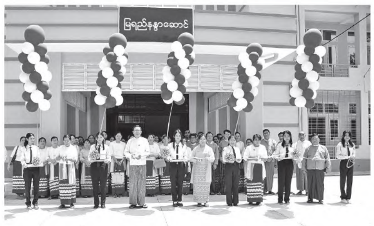
ပို့ဆောင်ရေးနှင့်ဆက်သွယ်ရေးဝန်ကြီးဌာန မြန်မာနိုင်ငံရေကြောင်းပညာတက္ကသိုလ် (သန်လျင်)၌ အသစ်တည်ဆောက်ပြီးစီးခဲ့သော ကျောင်းသားဆောင်(သံလွင်ဆောင်) နှင့် ကျောင်းသူဆောင်(မြရည်နန္ဒာဆောင်) ဖွင့်ပွဲအခမ်းအနားကို ယနေ့နံနက်ပိုင်းတွင်

တက္ကသိုလ်ပင်မဆောင်အစည်းအဝေးခန်းမ ၌ကျင်းပသည်။ ဖွင့်ပွဲအခမ်းအနားသို့ ပါမောက္ခချုပ် ဒေါက်တာမြတ်လွင်၊ ဒုတိယပါမောက္ခချုပ်များ၊ ပါမောက္ခ/ဌာနမှူးများ၊ တွဲဖက်ပါမောက္ခများ၊ အင်ဂျင်နီယာမှူးကြီးများ၊ ဌာနခွဲမှူးများ၊ တာဝန်ရှိသူများနှင့် ဖိတ်ကြားထားသော ဧည့်သည်တော်များ တက်ရောက်ကြပြီး ပါမောက္ခချုပ်၊ ဒုတိယပါမောက္ခချုပ်များနှင့် တာဝန်ရှိသူများက ကျောင်းသားဆောင် (သံလွင်ဆောင်)နှင့် ကျောင်းသူဆောင် (မြရည်နန္ဒာဆောင်)တို့ကို ဖဲကြီးဖြတ်ဖွင့်လှစ် ပေးကြကာ ကျောင်းသား၊ ကျောင်းသူများ နေထိုင်မည့်အခန်းများ၊ ထမင်းစားဆောင်၊ သန့်စင်ခန်း၊ ရေချိုးခန်းများနှင့် အဆောင်