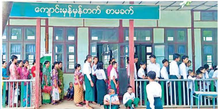
ကျောင်းမှန်မှန်တက် စာမခက်

သည်။ ထိုသို့ကျောင်းအပ်နှံမှု လက်ခံဆောင်ရွက်နေသည့် ဆရာ၊ ဆရာမများနှင့်