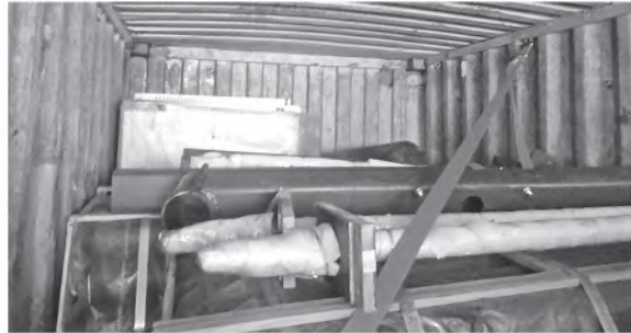
အေးရှားဝေါလ်ကုန်သေတ္တာစစ်ဆေးရေးစခန်း၌ ဖမ်းဆီးရမိမှု။