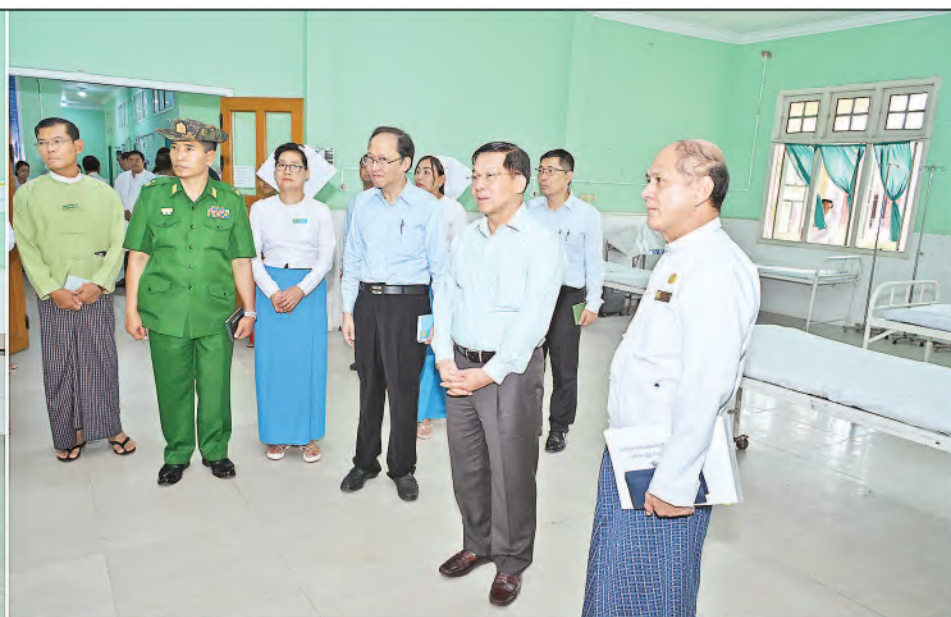
နိုင်ငံတော်စီမံအုပ်ချုပ်ရေးကောင်စီဥက္ကဋ္ဌ နိုင်ငံတော်ဝန်ကြီးချုပ် ဗိုလ်ချုပ်မှူးကြီးမင်းအောင်လှိုင် ပြင်ဦးလွင်မြို့၊ အထွေထွေရောဂါကုပြည်သူ့ဆေးရုံကြီးအတွင်း လှည့်လည်၍ လူနာဆောင်များနှင့်လူနာခန်းများ ပြင်ဆင်ထားရှိမှုအခြေအနေများကို ကြည့်ရှုစစ်ဆေးစဉ်။