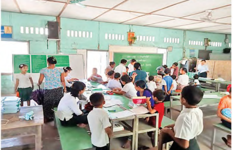
အနောက်တောင်တိုင်းစစ်ဌာနချုပ်ရှိ အခြေခံပညာကျောင်းများ၌ ကျောင်းအပ်လက်ခံနေမှုကို တွေ့ရစဉ်။

၂၀၂၄-၂၀၂၅ ပညာသင်နှစ်အတွက် အခြေခံပညာဦးစီးဌာနအောက်ရှိ အထက်တန်းအဆင့်၊ အလယ်တန်းအဆင့်နှင့် မူလတန်းအဆင့်ကျောင်းများကို ဇွန်လ ၃ ရက်တွင် စတင်ဖွင့်လှစ်မည်ဖြစ်ပြီး ကျောင်းအပ်နှံမှု သီတင်းပတ်အဖြစ် မေလ ၂၃ ရက်မှ ဇွန်လ ၂ ရက်အထိ သတ်မှတ်၍ ကျောင်းသား၊ ကျောင်းသူများအား ကျောင်းအပ်နှံမှု လက်ခံခြင်းများကို ဆောင်ရွက်လျက်ရှိသည်။ ထိုသို့ဆောင်ရွက်လျက်ရှိရာ ယနေ့ တွင်လည်း တိုင်းဒေသကြီးနှင့်ပြည်နယ်