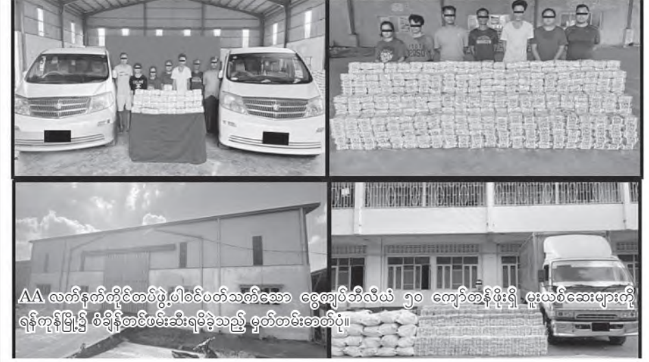
AA လက်နက်ကိုင်တပ်ဖွဲ့၏ဝင်ပတ်သက်ဆောင်ရွက်မှုများကို ရန်ကုန်မြို့၌ စိစစ်ဆန်းစစ်ရန်အတွက် မှတ်တမ်းဓာတ်ပုံ။