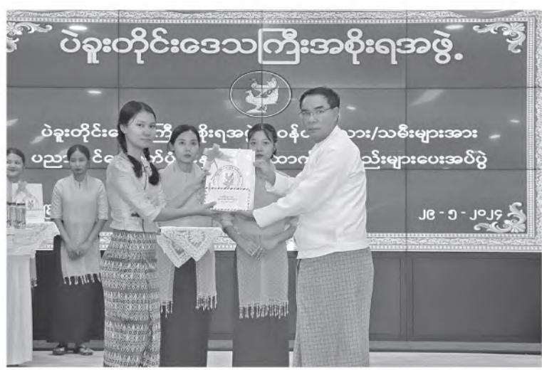
ကျောင်းသုံးဗလာစာအုပ် ၁၃၄ ဒါဇင်၊ ပညာသင်ထောက်ပံ့ငွေများ ပေးအပ်ခဲ့ ဘောပင် ၄၂ ဘူး၊ ခဲတံဘူး ၆၇ ဘူးနှင့် ကြောင်းသိရသည်။ ၄၀၁၊ တင်စိုး(ပဲခူး)

ပဲခူးတိုင်းဒေသကြီးအစိုးရအဖွဲ့အနေဖြင့် ၂၀၂၄-၂၀၂၅ ပညာသင်နှစ် ဝန်ထမ်းမိသား စုများ၊ လုံခြုံရေးဝန်ထမ်းမိသားစုများမှ အဆင့်မြင့်ပညာ သင်ကြားနေသည့် ကျောင်းသား၊ ကျောင်းသူ ခုနစ်ဦး၊ အထက် တန်းပညာသင်ကြားနေသူ ၂၀ ဦး၊ အလယ် တန်းပညာသင်ကြားနေသူ ၁၅ ဦး၊ မူလတန်း ပညာသင်ကြားနေသူ ၅၁ ဦးနှင့် မူလတန်း ကြိုပညာသင်ကြားနေသူ ၁၆ ဦး၊ စုစုပေါင်း ကျောင်းသား၊ ကျောင်းသူ ၁၀၉ ဦးအတွက်