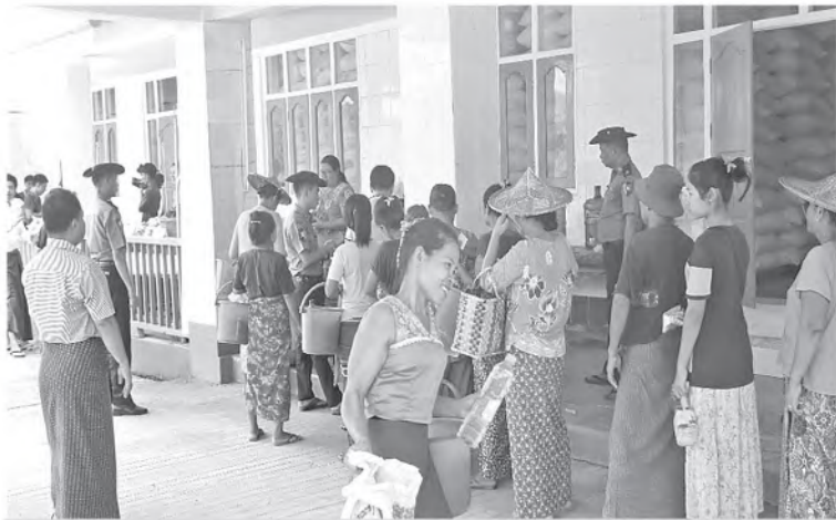
အမ်းမြို့ရှိဒေသခံပြည်သူများအား ဆန်၊ ဆီ၊ ဆား၊ ကြက်သွန်ဖြူ၊ ကြက်သွန်နီ၊ ငရုတ် စသည့် အခြေခံစားသောက်ကုန်များကို သက်သာသောဈေးနှုန်းဖြင့်ရောင်းချပေးစဉ်။

အမ်းမြို့သို့ရောက်ရှိလာရာ အနောက်ပိုင်း တိုင်းစစ်ဌာနချုပ် ဒုတိယတိုင်းမှူး ငိုလ်မှူးကြီး သောင်းထွန်းနှင့် တာဝန်ရှိသူများ၊ အမ်းခရိုင် စီမံအုပ်ချုပ်ရေးအဖွဲ့မှ တာဝန်ရှိသူများနှင့် မြို့မိမြို့ဖများ၊ ဒေသခံပြည်သူများက ဝမ်းပန်း တသာ ကြိုဆိုကြသည်။