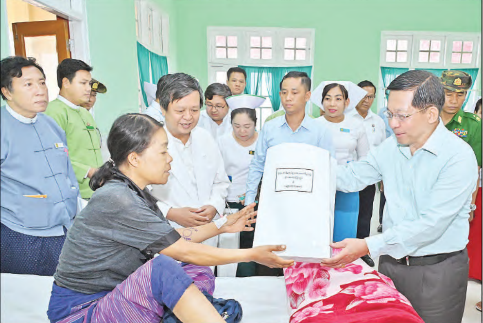
နိုင်ငံတော်စီမံအုပ်ချုပ်ရေးကောင်စီဥက္ကဋ္ဌ နိုင်ငံတော်ဝန်ကြီးချုပ် ဗိုလ်ချုပ်မှူးကြီးမင်းအောင်လှိုင် ပြင်ဦးလွင်မြို့၊ အထွေထွေရောဂါကုပြည်သူ့ဆေးရုံကြီးရှိ အနီးအကြောကုသဆောင်တွင် တက်ရောက်ဆေးကုသမှုခံယူလျက်ရှိသည့် ဒေသခံပြည်သူများ၏ ကျန်းမာရေးအခြေအနေများကို တစ်ဦးချင်းရင်းရင်းနှီးနှီးမေးမြန်းအားပေးစကားပြောကြားကာ ထောက်ပံ့ပစ္စည်းများပေးအပ်စဉ်။

အားနည်းချက်များရှိခဲ့ခြင်းကြောင့် သစ်ပင်သစ်တောများပြုန်းတီးခြင်းနှင့် သဘာဝပတ်ဝန်းကျင်ထိခိုက်မှုများရှိခဲ့ခြင်းဖြစ်ကြောင်း၊ လျော့ပါးသွားသည့် သစ်ပင်များပြန်လည်စိုက်ပျိုးသွားရန်လိုပြီး ပြင်ဦးလွင်မြို့တွင်သာမဟုတ်ဘဲ ဒေသတွင်းရှိ အခြားမြို့များတွင်လည်း သစ်ပင်များ စိုက်ပျိုးစေရေးဆောင်ရွက်