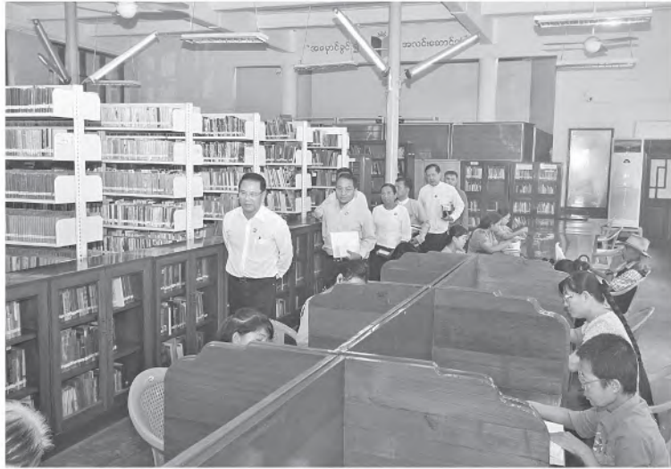
စာဖတ်ရှိန်မြှင့်တင်ရေးလုပ်ငန်းစဉ်တစ်ရပ်ကို ဆောင်ရွက်ရမည်ဖြစ်ကြောင်း၊ လူငယ်များ စာပေပိုမိုဖတ်ရှုကြရန်အတွက် စာဖတ်ရှိန်မြှင့်တင်ရေးကို အမြဲမပြတ်ကြိုးပမ်းဆောင်ရွက်သွားရမည်ဖြစ်ကြောင်း။

ထို့နောက် စာပေဗိမာန်ရုံးအစည်းအဝေးခန်းမ၌ အရာထမ်းများနှင့်တွေ့ဆုံသည်။ တွေ့ဆုံစဉ် ပြည်ထောင်စုဝန်ကြီးက စာအုပ်စာပေယဉ်ကျေးမှုသည် နိုင်ငံအတွက် အရေးပါပြီး စာပေမြင့်မှလူမျိုးတင့်မည်ဖြစ်ကြောင်း၊ နိုင်ငံတော်ဝန်ကြီးချုပ်က စာပေကို လေးစားမြတ်နိုးပြီး စာပေပညာရှင်များကို အထူးတန်ဖိုးထား အားပေးလျက်ရှိကာ စာပေကဏ္ဍဖွံ့ဖြိုးရေးတွင် တစိုက်မတ်မတ် ပံ့ပိုးဆောင်ရွက်ပေးလျက်ရှိကြောင်း။ စာပေဗိမာန်စာကြည့်တိုက်တွင် လာရောက်ဖတ်ရှုကြသည့် ပြည်သူများအပြင် ကျောင်းသား၊ ကျောင်းသူများ ပိုမိုလာရောက်ဖတ်ရှုနိုင်ရန် စာဖတ်ရှိန်မြှင့်တင်မှု ကဏ္ဍတစ်ရပ်အဖြစ် ဆောင်ရွက်သွားရမည် ဖြစ်ကြောင်း၊ ခေတ်စနစ်နှင့်ကိုက်ညီသည့်