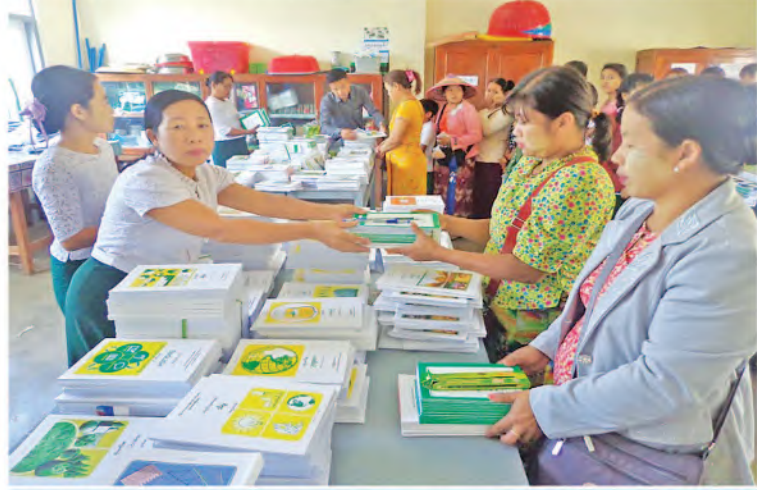
အရှေ့ပိုင်းတိုင်းစစ်ဌာနချုပ်ရှိ အခြေခံပညာကျောင်းများ၌ ကျောင်းအပ်လက်ခံနေမှုကို တွေ့ရစဉ်။