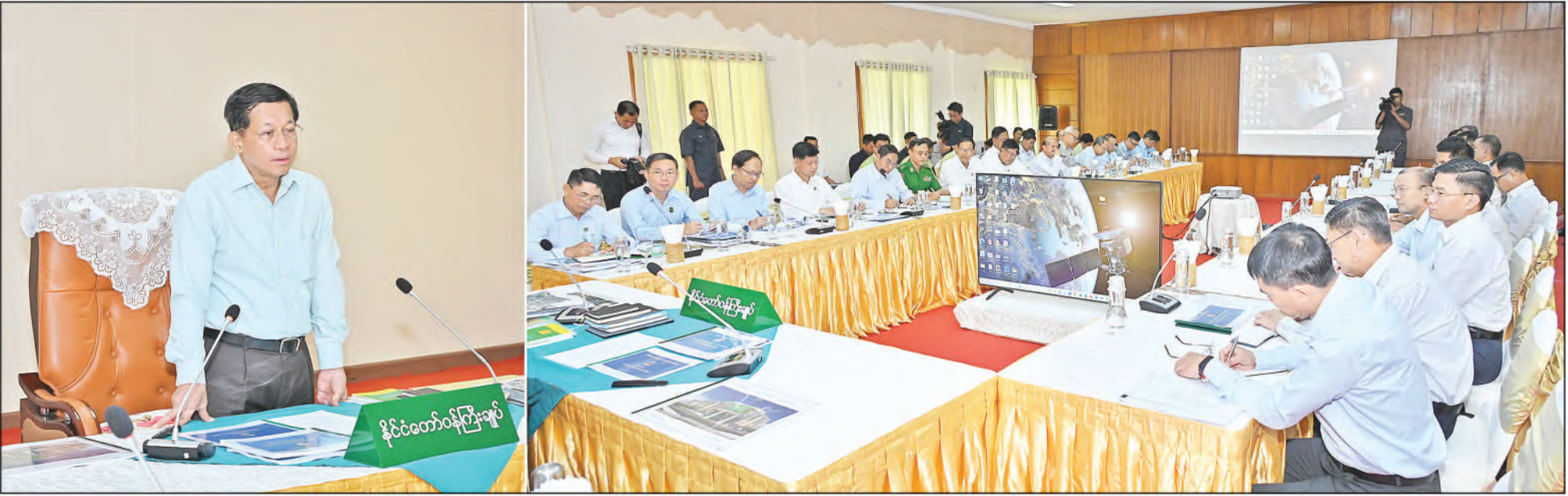
နိုင်ငံတော်စီမံအုပ်ချုပ်ရေးကောင်စီဥက္ကဋ္ဌ နိုင်ငံတော်ဝန်ကြီးချုပ် ဗိုလ်ချုပ်မှူးကြီးမင်းအောင်လှိုင် မန္တလေးတိုင်းဒေသကြီး ပြင်ဦးလွင်ခရိုင်နှင့် မြို့နယ်အတွင်းရှိ ဌာနဆိုင်ရာဝန်ထမ်းများအားတွေ့ဆုံ၍ ပြင်ဦးလွင်မြို့ သာယာလှပရေး ဖွံ့ဖြိုးတိုးတက်ရေးနှင့် ကော်ဖီတိုးချဲ့စိုက်ပျိုးနိုင်ရေးဆိုင်ရာကိစ္စရပ်များကို ဆွေးနွေးမှာကြားစဉ်။