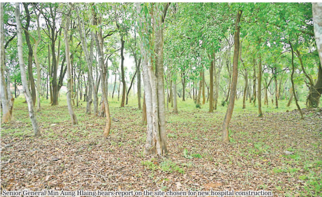
Senior General Min Aung Hlaing hears report on the site chosen for new hospital construction.