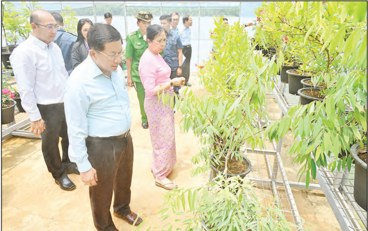
နိုင်ငံတော်စီမံအုပ်ချုပ်ရေးကောင်စီဥက္ကဋ္ဌ နိုင်ငံတော်ဝန်ကြီးချုပ် ဗိုလ်ချုပ်မှူးကြီးမင်းအောင်လှိုင်နှင့်ဇနီး ဒေါ်ကြူကြူလှတို့ အမျိုးသားကန်တော်ကြီး ဥယျာဉ်အတွင်း လှည့်လည်ကြည့်ရှုစစ်ဆေးစဉ်။

ကော်မီစိုက်ပျိုးမှုနှင့်ပတ်သက်၍ ကော်မီစီမံကိန်းသည် လွန်ခဲ့သည့် နှစ် ၂၀ ကျော်က စတင်ခဲ့သည့် နိုင်ငံတော်စီမံကိန်းတစ်ခုဖြစ်ကြောင်း၊ ကော်မီစိုက်ပျိုးရန်အတွက် ခွင့်ပြုပေးထားသည့် စိုက်ပျိုးမြေများအသုံးချမှုကို စည်းကမ်းနှင့်အညီထိန်းသိမ်းကြပ်မတ်ဆောင်ရွက်ရန်လိုကြောင်း၊ ကော်မီများ အောင်မြင်စွာ စိုက်ပျိုးနိုင်ရန်အတွက်လည်း တာဝန်ရှိသူများအနေဖြင့် လိုအပ်သည်များကို ကြပ်မတ်ဆောင်ရွက်ပေးနေရန်လိုကြောင်း၊ ကော်မီ