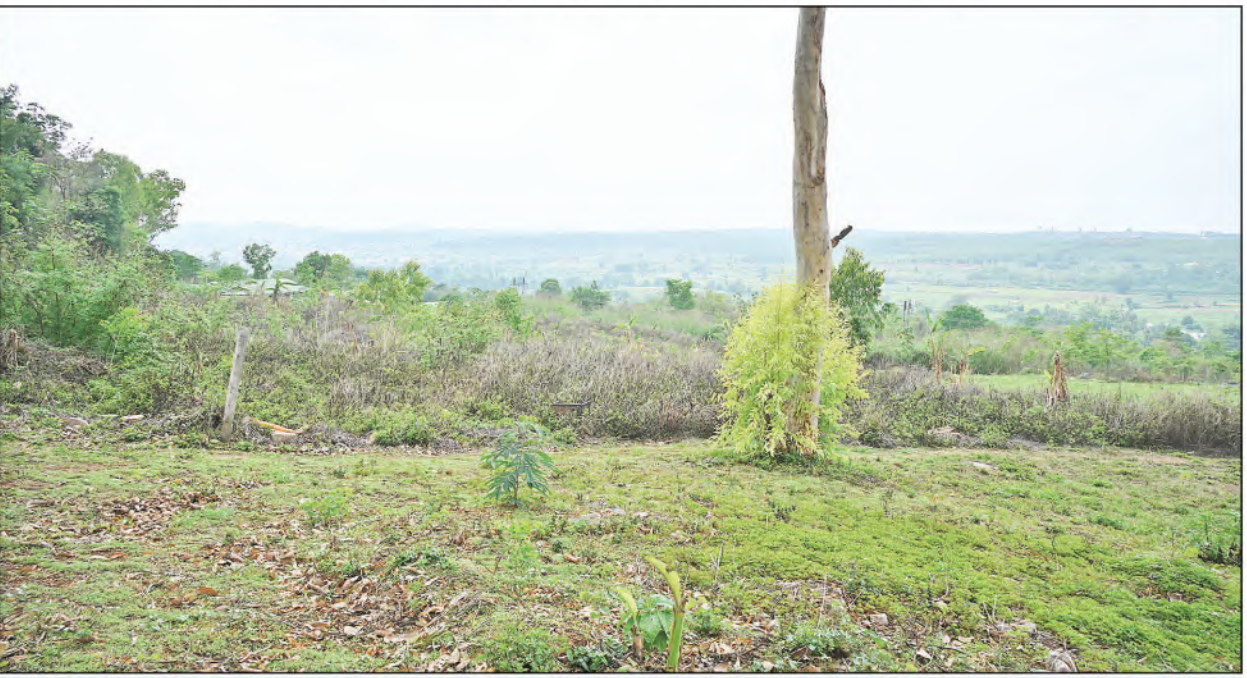
နိုင်ငံတော်စီမံအုပ်ချုပ်ရေးကောင်စီဥက္ကဋ္ဌ နိုင်ငံတော်ဝန်ကြီးချုပ် ဗိုလ်ချုပ်မှူးကြီးမင်းအောင်လှိုင် ပြင်ဦးလွင်မြို့ကို ကျန်းမာရေးမြို့တော်ဖြစ်စေရန်ရည်ရွယ်၍ ပုဂ္ဂလိကဆေးရုံများတည်ဆောက်ရန် လျာထားသည့်မြေနေရာများကို လိုက်လံကြည့်ရှုစစ်ဆေးစဉ်။