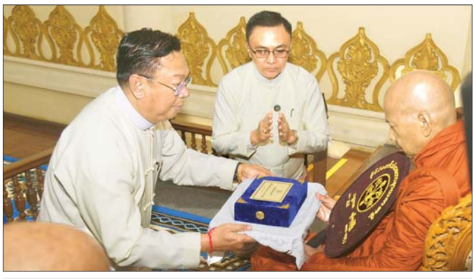
ပြည်ထောင်စုဝန်ကြီး ဗိုလ်ချုပ်ကြီး မိုးအောင် ဆရာတော်ထံ နိုင်ငံတော်အဆင့် အဆောင်အယောင်မော်တော်ယာဉ် ဆက်ကပ်အပ်နှံစဉ်။