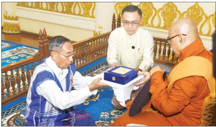
နိုင်ငံတော်စီမံအုပ်ချုပ်ရေးကောင်စီအဖွဲ့ဝင် မန်းငြိမ်းမောင် ဆရာတော်ထံ နိုင်ငံတော်အဆင့် အဆောင်အယောင်မော်တော်ယာဉ် ဆက်ကပ်အပ်နှံစဉ်။