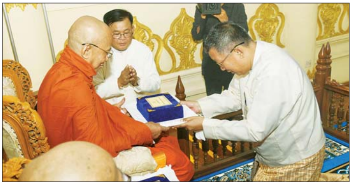
ပြည်ထောင်စုဝန်ကြီး ဦးတင်ဦးလွင် ဆရာတော်ထံ နိုင်ငံတော်အဆင့် အဆောင်အယောင်မော်တော်ယာဉ် ဆက်ကပ်အပ်နှံစဉ်။

သုံးရပ်၏ လုပ်ငန်းတာဝန်များကို ကြီးပမ်းစွာ ထမ်းဆောင်တော်မူကြသည့် သံဃာတော်အားလုံးကို ဦးဆောင်နေရသဖြင့် နိုင်ငံတော်၏ ဗုဒ္ဓသာသနာတော်အတွက် တာဝန်ကြီးမားစွာဖြင့် ဦးဆောင်နေရသည့် သံဃာအဖွဲ့အစည်းကြီးဖြစ်ပါကြောင်း။ နိုင်ငံတော် သံဃမဟာနာယကအဖွဲ့အနေဖြင့် သာသနာတော် သန့်ရှင်း၊ တည်တံ့၊ ပြန့်ပွားရေးအတွက် သံဃာအဖွဲ့အစည်းအဆင့်ဆင့်ကို ဦးဆောင်တာဝန်ယူဆောင်ရွက်နေသည့်ကာလတွင် သာသနာရေးဆိုင်ရာကိစ္စရပ်များနှင့် စပ်လျဉ်းသည့် သာသနာ့တာဝန်များကို စိတ်လက်ပေါ့ပါးစွာဖြင့် လွယ်ကူလျင်မြန်စွာ ထမ်းဆောင်တော်မူနိုင်ကြပါစေရန် ရည်သန်လျက် နိုင်ငံတော်စီမံအုပ်ချုပ်ရေးကောင်စီက မဟာနာယက ဆရာတော်ကြီးများထံ နိုင်ငံတော်အဆင့်