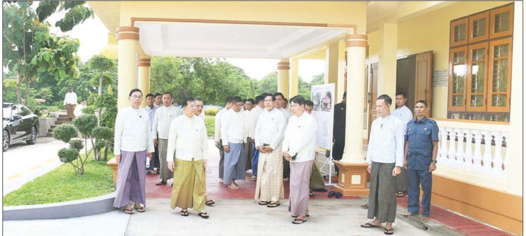
နိုင်ငံတော်စီမံအုပ်ချုပ်ရေးကောင်စီဥက္ကဋ္ဌ နိုင်ငံတော်ဝန်ကြီးချုပ် ဗိုလ်ချုပ်မှူးကြီး မင်းအောင်လှိုင်နှင့်အဖွဲ့ဝင်များ သီရိမင်္ဂလာကမ္ဘာအေးကုန်းမြေရှိ သာသနိက အဆောက်အဦများနှင့် လမ်းများ အဆင့်မြှင့်တင်ပြင်ဆင်ဆောင်ရွက်ထားရှိမှုအခြေအနေများကို လှည့်လည်ကြည့်ရှုစစ်ဆေးစဉ်။

ထို့နောက် နိုင်ငံတော်စီမံအုပ်ချုပ်ရေးကောင်စီ ဥက္ကဋ္ဌ နိုင်ငံတော်ဝန်ကြီးချုပ်နှင့် အဖွဲ့ဝင်များသည် သီရိမင်္ဂလာကမ္ဘာအေးကုန်းမြေရှိ သာသနိက အဆောက်အဦများ၊ ဟံသာသီရိကုန်းတော်ရှိ နိုင်ငံတော် ဩဝါဒါစရိယဆရာတော်ကြီးများနှင့် နိုင်ငံတော် ဗဟိုသံဃာ့ဝန်ဆောင်ဆရာတော်ကြီးများလာရောက် စဉ် မေတ္တသီတင်းသုံးသည့် အဆောင်များနှင့်လမ်းများ အဆင့်မြှင့်တင် ပြင်ဆင်ဆောင်ရွက်ထားရှိမှု အခြေအနေများကို လှည့်လည်ကြည့်ရှုစစ်ဆေးပြီး တာဝန်ရှိသူများ၏ တင်ပြချက်များအပေါ် လိုအပ် သည့်များ လမ်းညွှန်ဆွဲကြားခဲ့ကြောင်း သတင်းရရှိ သည်။ သတင်းစဉ်