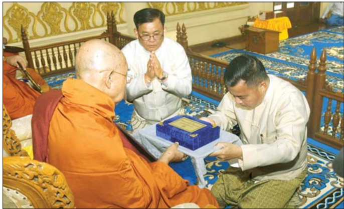
နိုင်ငံတော်စီမံအုပ်ချုပ်ရေးကောင်စီ တွဲဖက်အတွင်းရေးမှူး ဒုတိယဗိုလ်ချုပ်ကြီး ရဲဝင်းဦး ဆရာတော်ထံ နိုင်ငံတော်အဆင့် အဆောင်အယောင်မော်တော်ယာဉ် ဆက်ကပ်အပ်နှံစဉ်။