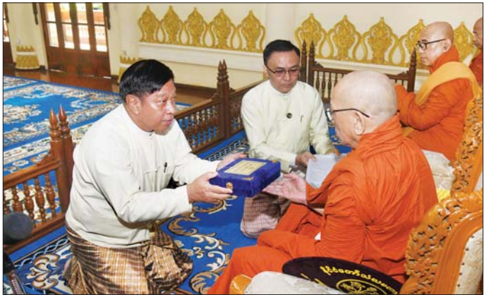
နိုင်ငံတော်စီမံအုပ်ချုပ်ရေးကောင်စီအဖွဲ့ဝင် ဗိုလ်ချုပ်ကြီး တင်အောင်စန်း ဆရာတော်ထံ နိုင်ငံတော်အဆင့် အဆောင်အယောင်မော်တော်ယာဉ် ဆက်ကပ်အပ်နှံစဉ်။