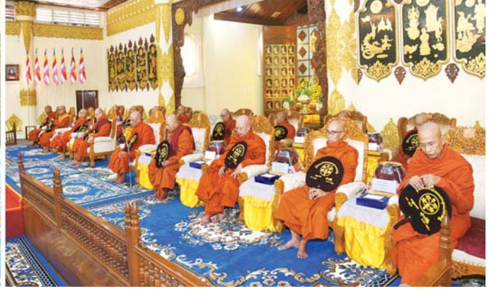
နိုင်ငံတော်စီမံအုပ်ချုပ်ရေးကောင်စီဥက္ကဋ္ဌ နိုင်ငံတော်ဝန်ကြီးချုပ် ဗိုလ်ချုပ်မှူးကြီး မင်းအောင်လှိုင်နှင့်အဖွဲ့ဝင်များ ဆရာတော်ကြီးများ ရွတ်ပွားချီးမြှင့်တော်မူသည့် မေတ္တာသုတ်ပရိတ်တရားတော်များကို နာယူကြစဉ်။