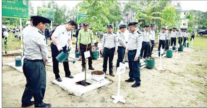
ပြည်နယ်သယံဇာတရေးရာဝန်ကြီး ဦးတိန်ဆောင် တို့က ပြည်နယ်/ ခရိုင်/ မြို့နယ်အဆင့်ဌာနဆိုင်ရာ များ၊ လူမှုကူညီရေးအသင်းအဖွဲ့များထံ လွှဲပြောင်း ပေးအပ်သည်။ ထို့နောက် ပြည်နယ်ဝန်ကြီးချုပ်၊ ပြည်နယ်တရား လွှတ်တော်တရားသူကြီးချုပ်၊ ပြည်နယ်ဝန်ကြီးများ၊

မြစ်ကြီးနား ဇွန် ၉ ရာသီဥတုပြောင်းလဲမှုနှင့် သဘာဝဘေးအန္တရာယ် လျော့ပါးစေရေး၊ မိုးခေါင်ရေရှားမှုနှင့် အပူဒဏ် ကာကွယ်ရေး၊ သစ်တောသယံဇာတများ ရေရှည် တည်တံ့စေရေး၊ ပြည်သူများ သစ်တောသစ်ပင်များ ၏ တန်ဖိုးကိုနားလည်ပြီး သစ်ပင်စိုက်ပျိုးခြင်းနှင့် သစ်တောပြုစုထိန်းသိမ်းခြင်း လုပ်ငန်းများတွင် ပိုမို ပူးပေါင်းပါဝင်လာစေရေး ရည်ရွယ်၍ ကချင်ပြည်နယ် သစ်တောဦးစီးဌာနက ကြီးမား၍ ဇွန် ၈ ရက်တွင် မြစ်ကြီးနားမြို့ နည်းပညာတက္ကသိုလ် ကျောင်းဝင်း အတွင်း၌ ၂၀၂၄ ခုနှစ် မိုးရာသီ သစ်ပင်စိုက်ပျိုးပွဲတော် ကျင်းပသည်။