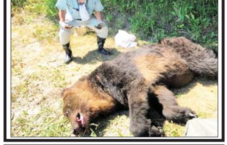
အစွဲရောင်းက ချူဆီရတ်ဒုက္ခသည်စခန်းကို တိုက်ခိုက်ရာမှ သေဆုံးသူ ၂၇၄ ဦးအထိ မြင့်တက်လာ

တိုကျို ဇွန် ၉ ဂျပန်နိုင်ငံအလယ်ပိုင်း နာဂါနိုပြည်နယ် တာကာယာမကျေးရွာ၌ ဇွန် ၈ ရက် နံနက် ၄ နာရီခွဲဝန်းကျင်က အသက် ၄၁ နှစ်အရွယ် အမျိုးသမီးတစ်ဦး ဝက်ဝံတိုက်ခိုက်ခံရသဖြင့် ပြင်းထန်စွာ ဒဏ်ရာရ ရှိကြောင်း သိရသည်။ ၎င်းမှာ သတင်းစာဝေနေစဉ် ဝက်ဝံက နောက်ဘက်မှ တိုက်ခိုက်ခဲ့ကြောင်း ရတပ်ဖွဲ့က ပြောကြားသည်။ အဆိုပါဝက်ဝံက ၎င်း၏ ညာဘက်လက်ကောက်ဝက်ကို ကိုက်ခဲ့ပြီး နောက်ကျောကိုလည်း ကုတ်ဖဲ့ခဲ့သဖြင့် ဒဏ်ရာပြင်းထန်ခဲ့ သောကြောင့် ဒဏ်ရာများ သက်သာစေရန် တစ်လခန့် ဆေးရုံ တက်ရောက်ကုသရမည်ဟု ခန့်မှန်းထားကြောင်း သိရသည်။ အလားတူ သောကြာနေ့ ညနေပိုင်းကလည်း ကိုဖျာဒါအီရကျေးရွာ ၌ အမျိုးသားတစ်ဦးသည်လည်း ဝက်ဝံတစ်ကောင် တိုက်ခိုက်ခံရ သဖြင့် အသေးစားဒဏ်ရာရရှိကြောင်း သိရသည်။ ဇွန် ၁ ရက်နှင့် ၂ ရက်ကလည်း အခြားလူနှစ်ဦးမှာ ဝက်ဝံ တိုက်ခိုက်ခံရသဖြင့် ဒဏ်ရာရရှိကြောင်း သိရသည်။ ပြည်နယ် အစိုးရက ဝက်ဝံအန္တရာယ် သတိပေးချက်ထုတ်ပြန်ထားပြီး နံနက် အစောပိုင်းနှင့် ညနေပိုင်းတို့တွင် ဝက်ဝံများ သွားလာလှုပ်ရှားနေ သဖြင့် တောင်နံဘေးများ၏ အဝေးမှ နေထိုင်ရန် ပြည်သူများကို တိုက်တွန်းထားကြောင်း သိရသည်။ အင်န်အိတ်ချ်ကေ