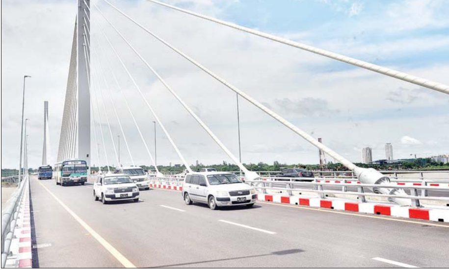
စာမျက်နှာ ၈ ကော်လံ ၁ င

နေပြည်တော် ဇွန် ၉ ရန်ကုန်တိုင်းဒေသကြီးအတွင်းရှိ ပဲခူးမြစ်ကူးတံတား(သန်လျင်တံတားအမှတ်-၃) ဖွင့်ပွဲအခမ်းအနားကို ဇွန် ၈ ရက် နံနက်ပိုင်းတွင် နိုင်ငံတော်စီမံအုပ်ချုပ်ရေးကောင်စီဥက္ကဋ္ဌ နိုင်ငံတော်ဝန်ကြီးချုပ် ဗိုလ်ချုပ်မှူးကြီး မင်းအောင်လှိုင် တက်ရောက်၍ ဖွင့်ပွဲအခမ်းအနားပြုခဲ့သည်။ အဆိုပါ ပဲခူးမြစ်ကူးတံတား (သန်လျင်တံတားအမှတ်-၃) အား ဖွင့်ပွဲအခမ်းအနား ပြီးဆုံးချိန်မှစ၍ မော်တော်ယာဉ်များ ဖြတ်သန်းသွားလာခွင့်ပေးခဲ့ရာ သန်လျင်မြို့သို့ အသွားအပြန်ပြုလုပ်လျက်ရှိသည့် မော်တော်ယာဉ်များသည် အဆိုပါတံတားအသစ်ကြီးမီမှ စည်ကားများပြားစွာဖြင့်