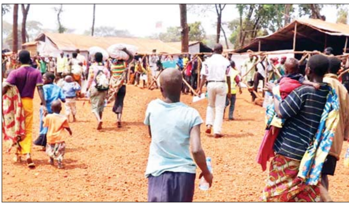
တန်ဇန်နီးယားနိုင်ငံအတွင်းမှ ဘူရုန်ဒီ ဒုက္ခသည်စခန်းတစ်ခုကို တွေ့ရပုံ။