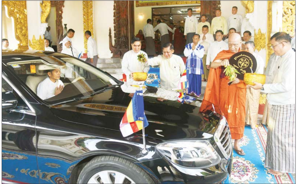
နိုင်ငံတော်သံဃမဟာနာယကအဖွဲ့ဥက္ကဋ္ဌ အဂ္ဂမဟာပဏ္ဍိတ အဂ္ဂမဟာသဒ္ဓမ္မဇောတိကဓဇ သန့်လှိုင်မင်းကျောင်းဆရာတော် ဒေါက်တာဘဒ္ဒန္တ စန္ဒိမာဘိဝံသနှင့် နိုင်ငံတော်စီမံအုပ်ချုပ်ရေးကောင်စီဥက္ကဋ္ဌ နိုင်ငံတော်ဝန်ကြီးချုပ် ဗိုလ်ချုပ်မှူးကြီး မင်းအောင်လှိုင်တို့ ဆရာတော်ကြီးထံ ဆက်ကပ်အပ်နှံထားရှိသည့် နိုင်ငံတော် အဆင့် အဆောင်အယောင်မော်တော်ယာဉ်အား ပရိတ်နံ့သာရည်များ ပက်ဖျန်း၍ သဒ္ဓါမင်္ဂလာဆင်ယင်စဉ်။

ထို့နောက် နိုင်ငံတော်သံဃမဟာနာယကအဖွဲ့ ဥက္ကဋ္ဌ သန့်လှိုင်မင်းကျောင်း ဆရာတော်ကြီးအမျိုးပြု သည့် ဆရာတော်ကြီးများက ၁၀၀၇ သုံးဂါထာနှင့်