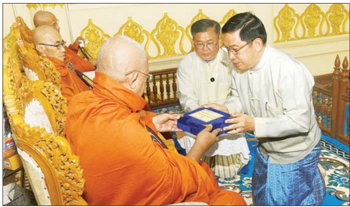
နိုင်ငံတော်စီမံအုပ်ချုပ်ရေးကောင်စီအဖွဲ့ဝင် ဒုတိယဗိုလ်ချုပ်ကြီး ညိုစော ဆရာတော်ထံ နိုင်ငံတော်အဆင့် အဆောင်အယောင်မော်တော်ယာဉ် ဆက်ကပ်အပ်နှံစဉ်။