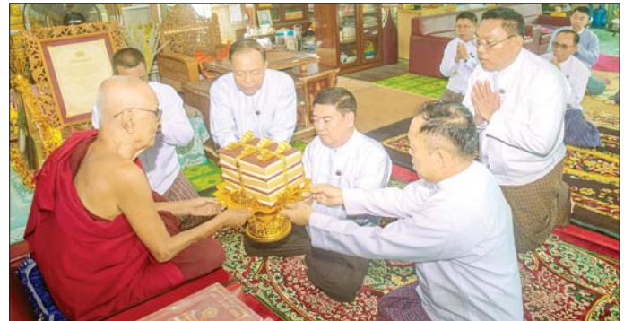
ပိဋကသုံးပုံပိဋတော် ကျမ်းစာအုပ်များ (မြန်မာ၊ ရှိမန်) အက္ခရာဂုဏ်ခံပေးခြင်းပြုထုထားရာ အဆိုပါ

မဟာဂန္ထဝါစကပဏ္ဍိတ ဘဒ္ဒန္တမေဃိယထံ ပိဋကသုံးပုံပိဋတော်ကျမ်းစာအုပ်များနှင့် လှူဖွယ်ဝတ္ထုများ ဆက်ကပ်လှူဒါန်းသည်။ ဆက်လက်၍ ဆရာတော်ပုံ ပိဋတော်ကျမ်းစာအုပ်များ လှူဒါန်းရခြင်း၏ အကျိုးတရားများကို နာကြားကြပြီး လှူဒါန်းမှုအစုစုအတွက် ရေစက်သွန်းလောင်း အမျှပေးခေခဲ့ကြသည်။ မာရဝိဇယ ဗုဒ္ဓရုပ်ပွားတော် မြတ်ကြီး၏ ဦးဆောင်ဘုရား ဒါယကာ နိုင်တော်အကြီးအကဲ ကလှူဒါန်းသော ဆဋ္ဌသင်ဂါယနာမူ