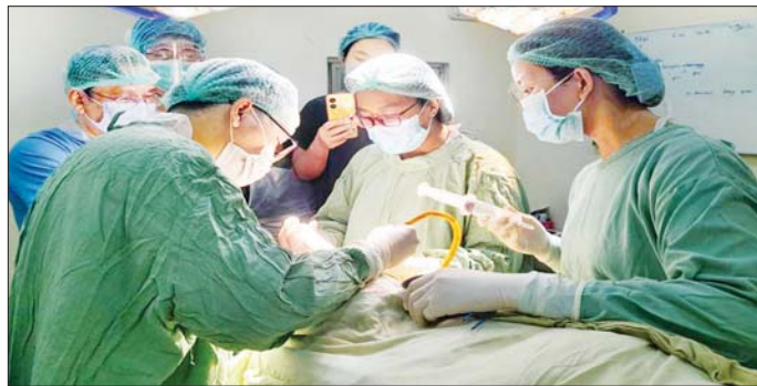
ဦးနှောက်တွင်း သွေးခဲဖယ်ထုတ်သည့် ခွဲစိတ်ကုသမှု (Burrhole Surgery) ဆောင်ရွက်စဉ်။

နေပြည်တော် ဇွန် ၉ ကျန်းမာရေး ဝန်ကြီးဌာနသည် တစ်မျိုးသားလုံး သက်ရည်ကျန်းမာ ကြံ့ခိုင်ရေးအတွက် ပြည်သူ့အားလုံး အကျိုးဝင်မည့် ကျန်းမာရေး စောင့်ရှောက်မှုကို မြှင့်တင်ဆောင်ရွက်ရာတွင် ပြည်သူများ လိုအပ်သော ကျန်းမာရေး စောင့်ရှောက်မှုကို လက်လှမ်းမီ ရရှိစေခြင်းဖြင့် ရောဂါကင်းဝေး၍ သက်တမ်းစေ့ နေထိုင်နိုင်စေရေး သက်ဆိုင်ရာ ပါမောက္ခ၊ အထူးကုဆရာဝန်ကြီးများနှင့်တွေ့ဆုံကာ လိုအပ်သောကုသမှုများ ရရှိနိုင်စေရန် ရန်ကုန်၊ မန္တလေးနှင့် နေပြည်တော်တို့မှ ပါမောက္ခ၊ အထူးကုဆရာဝန်ကြီးများပါဝင်သည့် အထူးကုဆေးကုသရေး အဖွဲ့များဖြင့် တိုင်းဒေသကြီးနှင့် ပြည်နယ်များသို့ ကွင်းဆင်းကုသမှု အစီအစဉ်များ ဆောင်ရွက်လျက်ရှိသည်။ ရန်ကုန် ပြည်သူ့ဆေးရုံကြီး၊