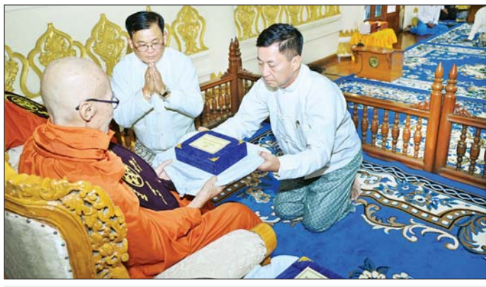
နိုင်ငံတော်စီမံအုပ်ချုပ်ရေးကောင်စီအဖွဲ့ဝင် ခွန်စုံလွင် ဆရာတော်ထံ နိုင်ငံတော်အဆင့် အဆောင်အယောင်မော်တော်ယာဉ် ဆက်ကပ်အပ်နှံစဉ်။