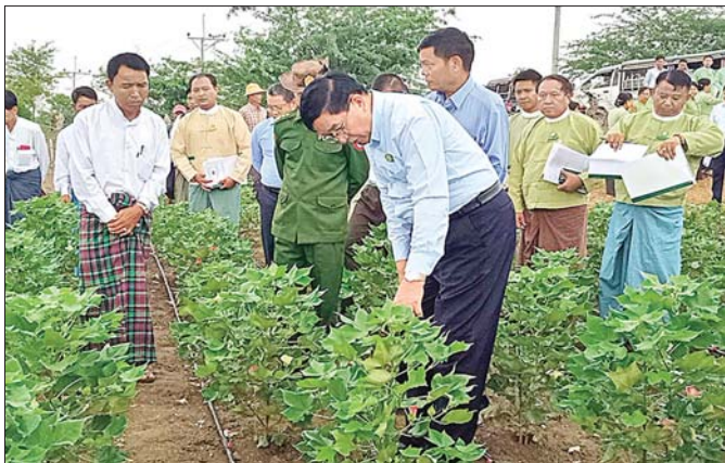
မကွေးတိုင်းဒေသကြီးဝန်ကြီးချုပ် ဦးတင်လွင် ချည်မျှင်ရည်ဝါစိုက်ခင်းကို သွားရောက်ကြည့်ရှုစဉ်။ (၂၀၂၃ ခုနှစ် ဩဂုတ် ၂၉ ရက်)

ပြည်တွင်းမှ ထွက်ရှိသော ဝါများကို ဝါကြိတ် စက်ရုံများတွင် ကြိတ်ခြွင်းပြီး ချည်မျှင်စက်ရုံများ၌ အဆင့်မီချည်ထုတ်လုပ်ခြင်း၊ အထည်အလိပ်စက်ရုံ များ၌ ပိတ်များထုတ်လုပ်ခြင်း၊ အထည်ချုပ်စက်ရုံ များ၌ အဝတ်အထည်များ ထုတ်လုပ်ခြင်းတို့ဖြင့် အလုပ်ငန်းကဏ္ဍ တိုးတက်ရေး ဆောင်ရွက်ကြရမည်