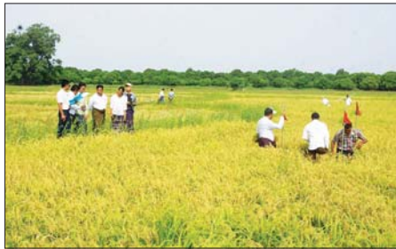
နိုင်ငံအဝန်း သစ်တောစွမ်းဖြင့် စိမ်းလန်းစေရမည်