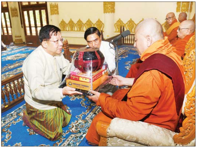
နိုင်ငံတော်စီမံအုပ်ချုပ်ရေးကောင်စီဥက္ကဋ္ဌ နိုင်ငံတော်ဝန်ကြီးချုပ် ဗိုလ်ချုပ်မှူးကြီး မင်းအောင်လှိုင် နိုင်ငံတော်သံဃမဟာနာယကအဖွဲ့အကျိုးတော်ဆောင် မန္တလေးမြို့ မစိုးရိမ်တိုက်သစ်မဟာနာယက ဓမ္မသမိဒ္ဓိကျောင်း ဆရာတော်အဂ္ဂမဟာပဏ္ဍိတ အဂ္ဂမဟာသာဒ္ဓမ္မဇောတိကဓမ္မ မဟာဓမ္မကထိက ဗဟုဇန ဟိတဓရ ဘဒ္ဒန္တဝါသေဋ္ဌာတိဝံသထံ နိုင်ငံတော်အဆင့် အဆောင်အယောင်မော်တော်ယာဉ် ဆက်ကပ် အပ်နှံပြီး လှူဖွယ်ပစ္စည်းများ ဆက်ကပ်လှူဒါန်းစဉ်။

နိုင်ငံတော်အစိုးရသည် နှစ်စဉ် ဇန်နဝါရီလ ၄ ရက်၊ လွတ်လပ်ရေးနေ့ အခါသမယရောက်တိုင်း ဂန္ဓဇရု၊ ဝိဿနာဓုရ ဟူသော ဓုရနစ်ဖြာသာသနာကို တည်တံ့ပြန့်ပွားအောင်၊ ထွန်းလင်းစေစည်အောင်