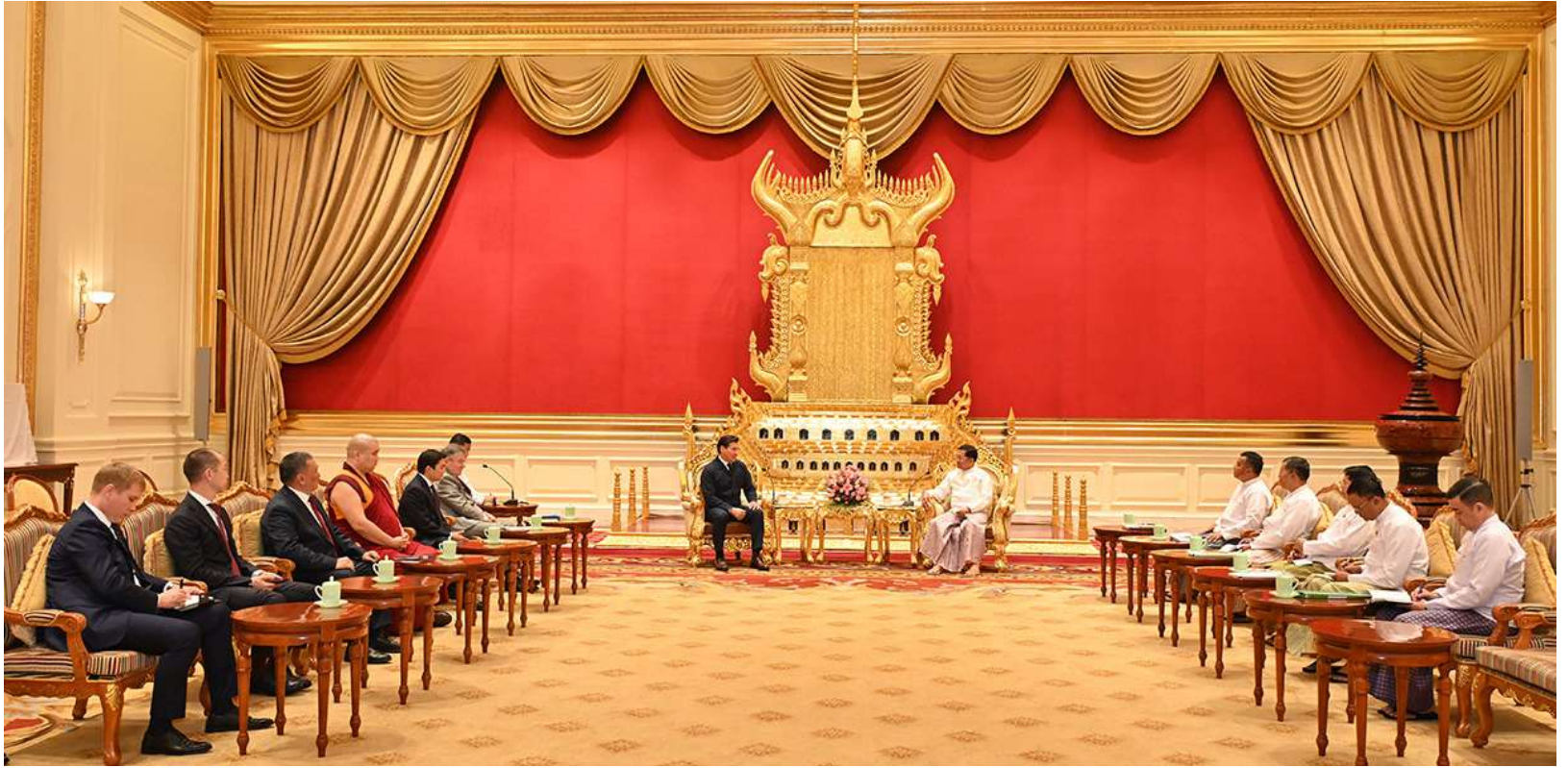
နိုင်ငံတော်စီမံအုပ်ချုပ်ရေးကောင်စီဥက္ကဋ္ဌ နိုင်ငံတော်ဝန်ကြီးချုပ် ဗိုလ်ချုပ်မှူးကြီးမင်းအောင်လှိုင် ရုရှားဖက်ဒရေးရှင်းနိုင်ငံ ကာလ်မီးကီယာပြည်နယ်အကြီးအကဲ H.E. Mr. Batu KHASIKOV ဦးဆောင်သောကိုယ်စားလှယ်အဖွဲ့ကို လက်ခံတွေ့ဆုံစဉ်။