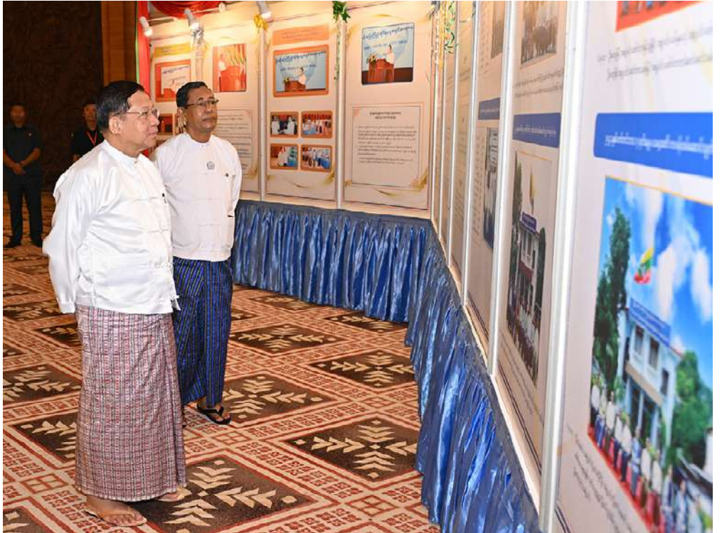
နိုင်ငံတော်စီမံအုပ်ချုပ်ရေးကောင်စီဥက္ကဋ္ဌ နိုင်ငံတော်ဝန်ကြီးချုပ် ဗိုလ်ချုပ်မှူးကြီးမင်းအောင်လှိုင် မြန်မာနိုင်ငံအမျိုးသားလူ့အခွင့်အရေးကော်မရှင်၏ လူ့အခွင့်အရေးမြှင့်တင်ရေးနှင့် ပညာပေးရေးလုပ်ငန်းများ အကောင်အထည်ဖော်ဆောင်ရွက်မှုမှတ်တမ်းဓာတ်ပုံများကို လှည့်လည်ကြည့်ရှုစဉ်။

ကြောင်း၊ ကမ္ဘာ့လူ့အခွင့်အရေးကြေညာစာတမ်းပါ အရေးကြီးသည့်လူ့အခွင့်အရေးစံများကို လိုက်လျောညီထွေစွာထည့်သွင်းပြဋ္ဌာန်းပေးထားသည်ကို တွေ့ရှိနိုင်မည်ဖြစ်ကြောင်း၊ မြန်မာနိုင်ငံ၏ နိုင်ငံတော်သီချင်းတွင်လည်း တရားမျှတခြင်း၊ လွတ်လပ်ခြင်းနှင့် ညီမျှခြင်းဟူသည့် လူ့အခွင့်အရေးစံများဖော်ညွှန်းပါဝင်သည်ကို တွေ့နိုင်ကြောင်း၊ ယင်းအချက်များသည် မြန်မာနိုင်ငံသည် ကမ္ဘာ့လူ့အခွင့်အရေးကြေညာစာတမ်းကို