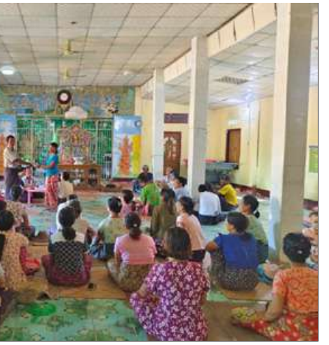
နှမ်းစိုက်ပျိုးရေးလုပ်ငန်း လုပ်ကိုင်သူ ၅၂ ထုတ်ချေးပေးခဲ့ကြောင်း သိရသည်။ ဦးကို ရန်ပုံငွေကျပ် ၂၀ ဒသမ ၁၃ သန်း သံသာ

များ၊ ကျေးလက်ဒေသ ဖွံ့ဖြိုးတိုးတက်ရေး ဥပဒေပါ ကျေးလက်နေ ပြည်သူများ လိုက်နာရမည့်တာဝန်များ၊ ရပိုင်ခွင့်များကို အသေးစိတ် ရှင်းလင်းပြောကြားပြီး မြစ်မ်းရောင်ကျေးရွာစီမံကိန်း လုပ်ငန်းအဖွဲ့ဝင်များထံ စီမံကိန်းရန်ပုံငွေများ လွှဲပြောင်းပေးအပ်သည်။ ထို့နောက် မြစ်မ်းရောင်ကျေးရွာ စီမံကိန်းလုပ်ငန်းအဖွဲ့ဝင်များက ပြည့်စင်ကွင်းကျေးရွာရှိ ဆီထွက်သီးနှံဖြစ်သော