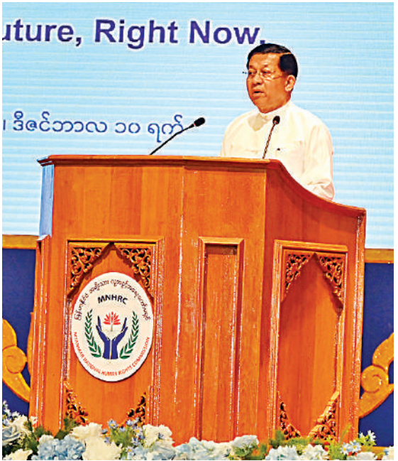
နိုင်ငံတော်စီမံအုပ်ချုပ်ရေးကောင်စီဥက္ကဋ္ဌ နိုင်ငံတော်ဝန်ကြီးချုပ် ဗိုလ်ချုပ်မှူးကြီးမင်းအောင်လှိုင် (၇၆)နှစ်မြောက် အပြည်ပြည်ဆိုင်ရာလူ့အခွင့်အရေးနေ့အခမ်းအနားတွင် အမှာစကားပြောကြားစဉ်။

နေပြည်တော် ဒီဇင်ဘာ ၁၀ (၇၆)နှစ်မြောက် အပြည်ပြည်ဆိုင်ရာ လူ့အခွင့်အရေးနေ့အခမ်းအနားကို ယနေ့ နံနက်ပိုင်းတွင် နေပြည်တော်ရှိ မြန်မာ အပြည်ပြည်ဆိုင်ရာ ကွန်ဗင်းရှင်းဗဟို ဌာန-၁ ၌ ကျင်းပပြုလုပ်ရာ နိုင်ငံတော်စီမံ အုပ်ချုပ်ရေးကောင်စီဥက္ကဋ္ဌ နိုင်ငံတော် ဝန်ကြီးချုပ် ဗိုလ်ချုပ်မှူးကြီးမင်းအောင်လှိုင် တက်ရောက်အမှာစကားပြောကြားသည်။ မင်းအောင်လှိုင်က ပြည်ထောင်စုအဆင့်ပုဂ္ဂိုလ်များနှင့် ပြည်ထောင်စုဝန်ကြီးများ၊ နေပြည်တော် တိုင်းစစ်ဌာနချုပ် အခမ်းအနားသို့ နိုင်ငံတော်စီမံအုပ်ချုပ်ရေးကောင်စီ တွဲဖက်အတွင်းရေးမှူး ဗိုလ်ချုပ်ကြီးရဲဝင်းဦး၊ ကောင်စီအဖွဲ့ဝင် များ၊ ပြည်ထောင်စုအဆင့်ပုဂ္ဂိုလ်များနှင့် ပြည်ထောင်စုဝန်ကြီးများ၊ နေပြည်တော် တိုင်းမဟာနဂါးကြီး မြန်မာနိုင်ငံ အမျိုးသားလူ့အခွင့်အရေး ကော်မရှင်မှ တာဝန်ရှိသူများ၊ အရပ်ဘက်အဖွဲ့အစည်း များဖိတ်ကြားထားသူများနှင့်ကျောင်းသား၊ ကျောင်းသူများ တက်ရောက်ကြသည်။ ဦးစွာ နိုင်ငံတော်စီမံအုပ်ချုပ်ရေး ကောင်စီဥက္ကဋ္ဌ နိုင်ငံတော်ဝန်ကြီးချုပ်က အမှာစကားပြောကြားရာတွင် ယနေ့ ၂၀၂၄ ခုနှစ် ဒီဇင်ဘာ ၁၀ ရက်သည် ကုလ သမဂ္ဂအထွေထွေညီလာခံက ကမ္ဘာ့ လူ့အခွင့်အရေး ကြေညာစာတမ်းကို ထုတ်ပြန်ကြေညာခဲ့သည့် ၇၆ နှစ်ပြည့်မြောက်သည့်နေ့ဖြစ်ကြောင်း၊ ယင်းနေ့ကို ဂုဏ်ပြုသတ်မှတ်သည့် အပြည်ပြည်ဆိုင်ရာ လူ့အခွင့်အရေးနေ့ သည်လည်း (၇၆)နှစ်မြောက် အခါသမယ ကို ရောက်ရှိလာပြီဖြစ်ကြောင်း။ မိမိတို့မြန်မာနိုင်ငံသည် ၁၉၄၈ ခုနှစ် ဇန်နဝါရီလ စာမျက်နှာ ၁၆ ကော်လံ ၁၂