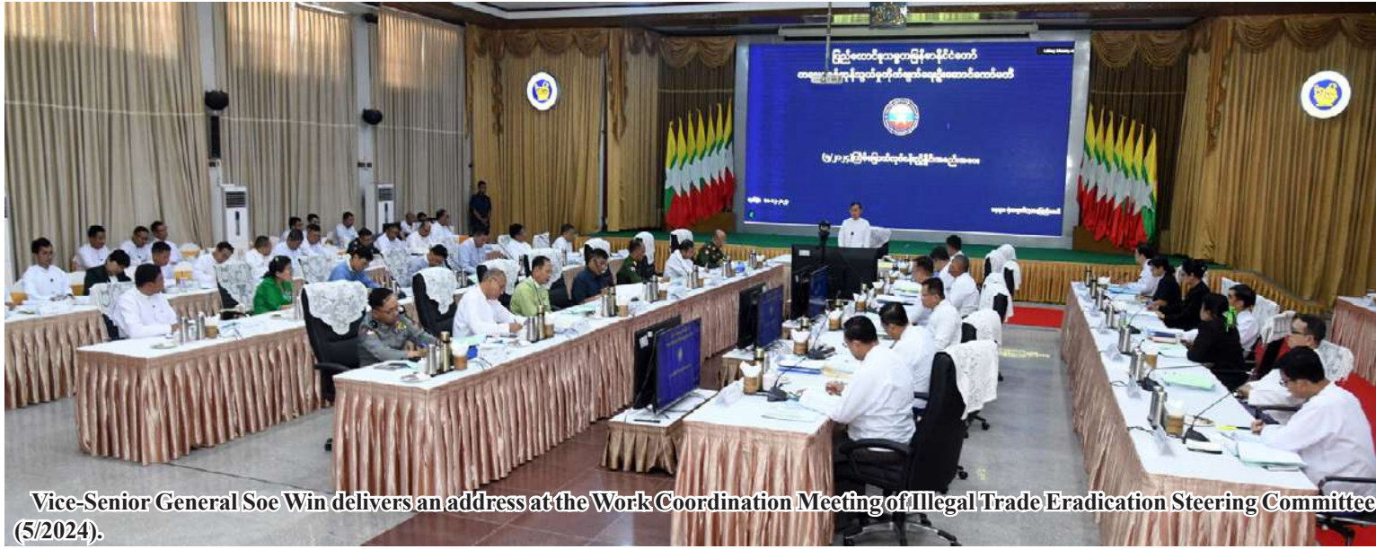
Vice-Senior General Soe Win delivers an address at the Work Coordination Meeting of Illegal Trade Eradication Steering Committee (5/2024).

Nay Pyi Taw December 10 Work Coordination Meeting of the Illegal Trade Eradication Steering Committee (5/2024) was held at the conference hall of the Ministry of Commerce in Nay Pyi Taw this afternoon and Chairman of the steering committee Vice Chairman of the State Administration Council Deputy Prime Minister Vice-Senior General Soe Win delivered an address at the meeting.