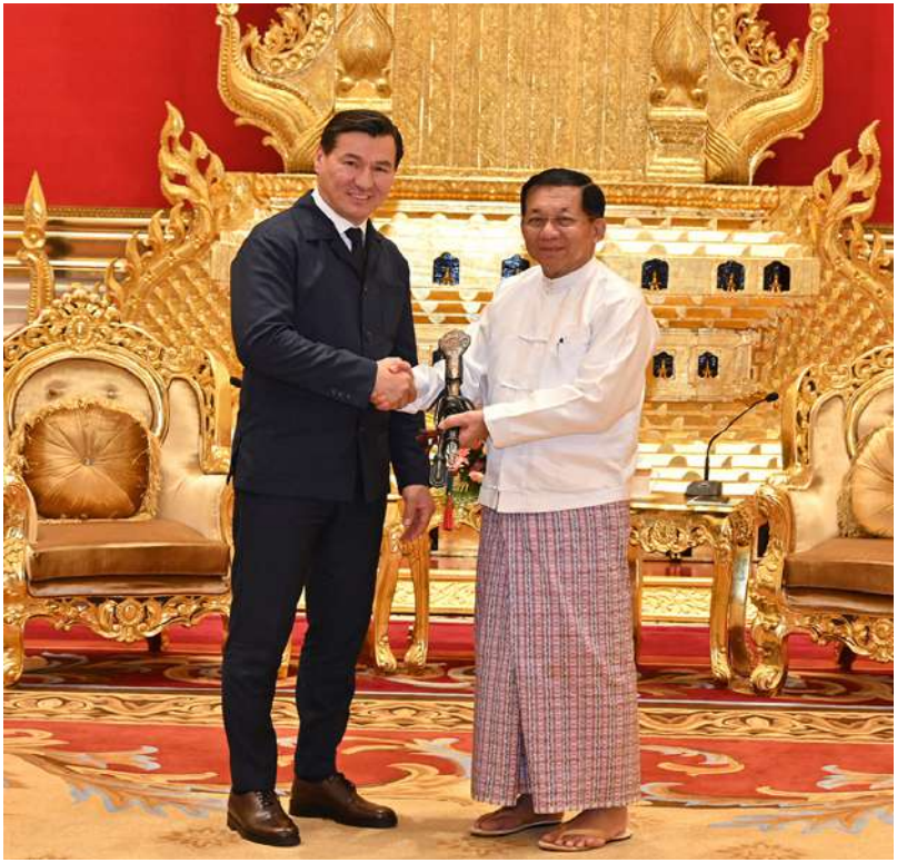
နိုင်ငံတော်စီမံအုပ်ချုပ်ရေးကောင်စီဥက္ကဋ္ဌ နိုင်ငံတော်ဝန်ကြီးချုပ် ဗိုလ်ချုပ်မှူးကြီးမင်းအောင်လှိုင်နှင့် ရုရှားဖက်ဒရေးရှင်းနိုင်ငံ ကာလ်မီးကီယာပြည်နယ်အကြီးအကဲ H.E. Mr. Batu KHASIKOV တို့ အမှတ်တရလက်ဆောင်ပစ္စည်းများ အပြန်အလှန်ပေးအပ်စဉ်။

သည့် အနာဂတ်ကို ဖန်တီးတည်ဆောက်ကြ ရမည်ဖြစ်ကြောင်း၊ ယနေ့ခေတ် ကမ္ဘာကြီး တွင် မငြိမ်သက်မှုနှင့် ပဋိပက္ခများအပါအဝင် အခက်အခဲပေါင်းများစွာနှင့် ရင်ဆိုင်နေကြရ ကြောင်း၊ ယင်းအခက်အခဲများကို ကျော်လွှား လွန်မြောက်ရန်နှင့် ငြိမ်းချမ်းသာယာပြော ပြီး တရားဥပဒေစိုးမိုးသည့် လောကတည် ဆောက်ရန်အတွက် စည်းကမ်းစနစ်ကျနမှု ရှိသည့် လူ့အခွင့်အရေးလိုက်နာဆောင်ရွက် မှုများက ပံ့ပိုးဖော်ဆောင်ပေးနိုင်မည်ဖြစ် ကြောင်း၊ တန်းတူညီမျှမှုမရှိသည့်၊ ခွဲခြား ဆက်ဆံသည့် စနစ်ပုံစံများသည် လူ့အခွင့် အရေးစံများနှင့် ဆန့်ကျင်ဘက်ဖြစ်ကြောင်း။