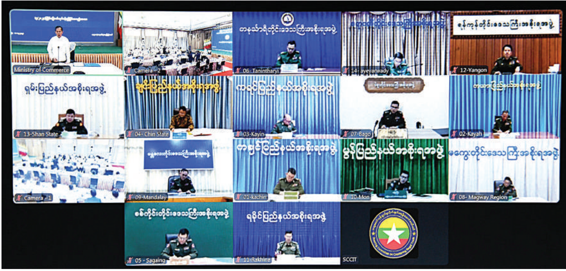
တရားမဝင်ကုန်သွယ်မှုတိုက်ဖျက်ရေးဦးဆောင်ကော်မတီ လုပ်ငန်းညှိနှိုင်းအစည်းအဝေး (၅/၂၀၂၄)သို့ တိုင်းဒေသကြီးနှင့် ပြည်နယ် တရားမဝင်ကုန်သွယ်မှုတိုက်ဖျက်ရေးအထူးအဖွဲ့ဥက္ကဋ္ဌများက ဗီဒီယိုကွန်ဖရင့်စနစ်ဖြင့် တက်ရောက်စဉ်။

ပို့ကုန် တင်ပို့မှုအပိုင်းတွင်လည်း နိုင်ငံတော်ဝန်ကြီးချုပ်က ပို့ကုန်နှစ်ဆ တိုးမြှင့်နိုင်ရေးကိုလည်း လမ်းညွှန်ထားပါ ကြောင်း၊ ပို့ကုန်နှစ်ဆတိုးမြှင့်နိုင်ရေး အတွက် တစ်ဖက်တစ်လမ်းကဆောင်ရွက် နေသည့် MSMEs ကုန်ထုတ်လုပ်ငန်းများ နှင့် ဆက်သွယ်ထုတ်လုပ်သည့် ပြည်တွင်း လုပ်ငန်းရှင်များအနေဖြင့် ထုတ်ကုန်များ တိုးမြှင့်ထုတ်လုပ်ရာတွင် တရားမဝင် ကုန်သွယ်မှုသည် လုပ်ငန်းရှင်များ အရည် အသွေးမီ ဈေးကွက်ဝင်ကုန်ပစ္စည်းများ ထုတ်လုပ်ရေးအတွက် များစွာအဟန့် အတားဖြစ်နေပြီး ထိခိုက်နစ်နာဆုံးရှုံးမှု များရှိနေနိုင်သည်ကို သတိပြုကြရန်