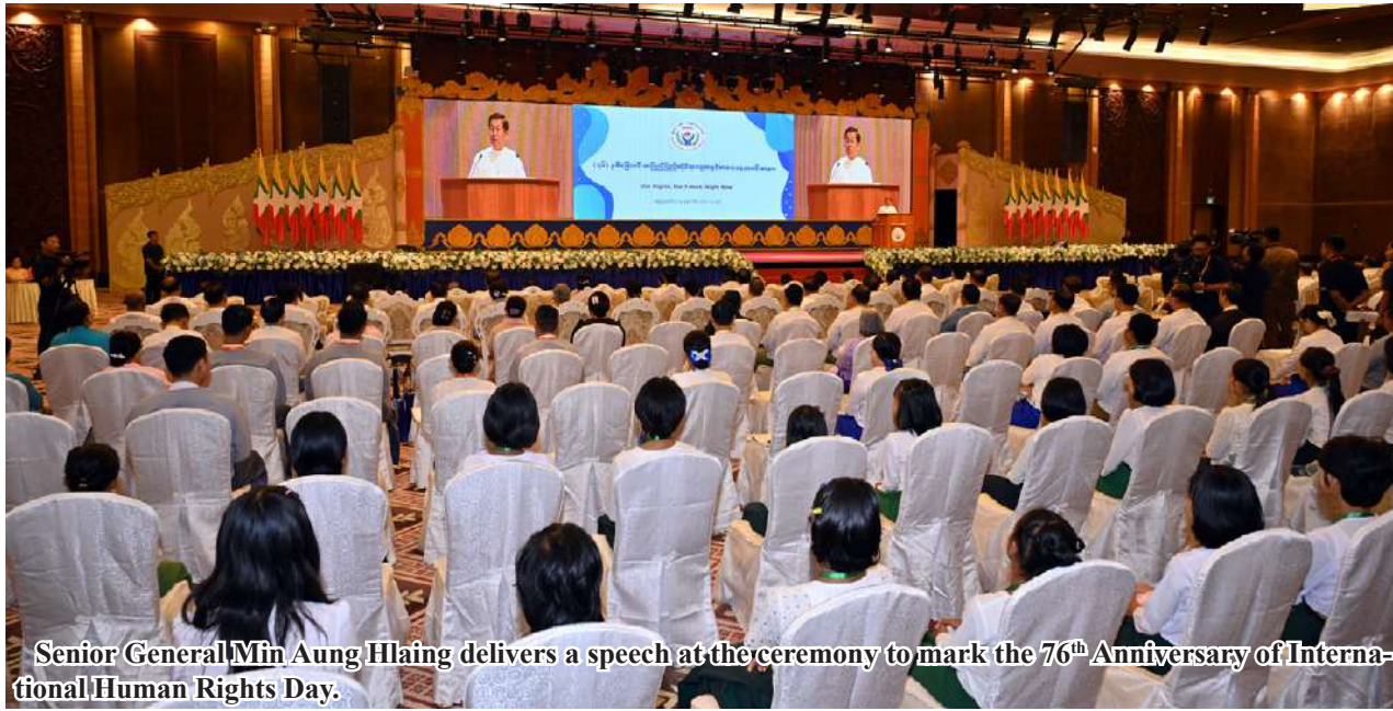
Senior General Min Aung Hlaing delivers a speech at the ceremony to mark the 76 th Anniversary of International Human Rights Day.