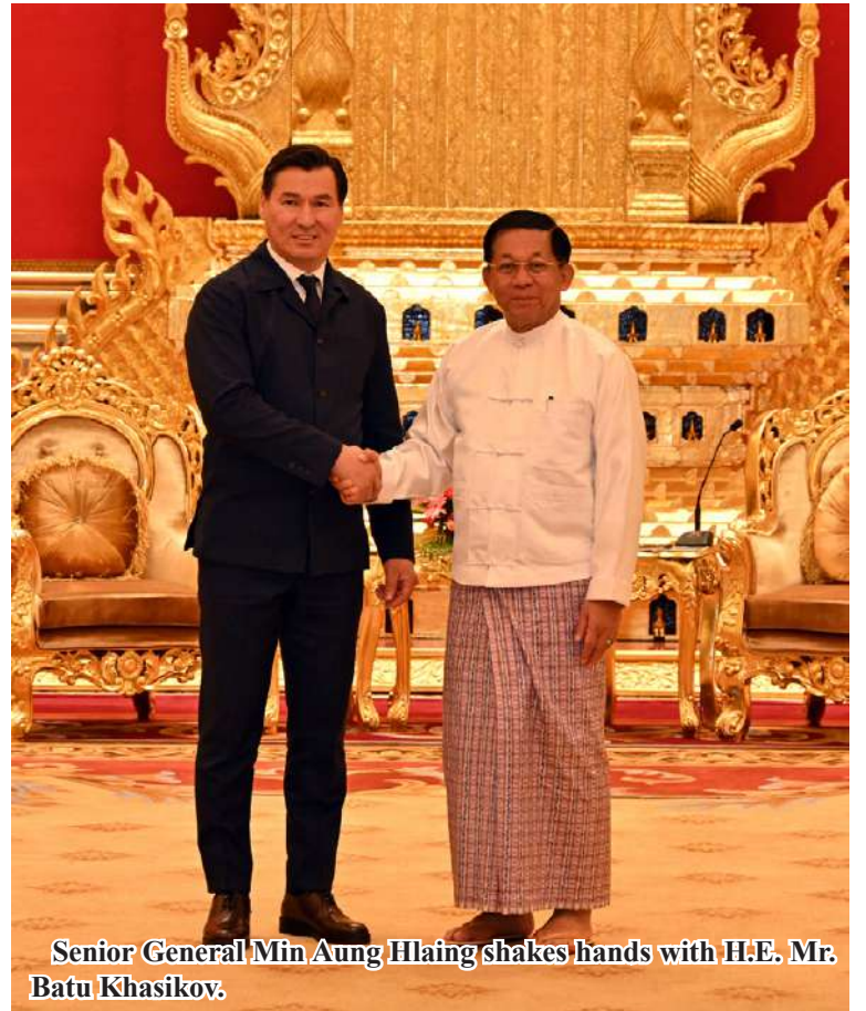
Senior General Min Aung Hlaing shakes hands with H.E. Mr. Batu Khasikov.