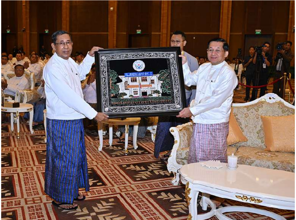
နိုင်ငံတော်စီမံအုပ်ချုပ်ရေးကောင်စီဥက္ကဋ္ဌ နိုင်ငံတော်ဝန်ကြီးချုပ် ဗိုလ်ချုပ်မှူးကြီးမင်းအောင်လှိုင်ထံ မြန်မာနိုင်ငံအမျိုးသားလူ့အခွင့်အရေးကော်မရှင်ဥက္ကဋ္ဌက (၇၆)နှစ်မြောက် အပြည်ပြည်ဆိုင်ရာ လူ့အခွင့်အရေးနေ့အထိမ်းအမှတ်တံဆိပ်ကို ဂါရဝပြုပေးအပ်စဉ်။

အကြမ်းဖက်သည့် နည်းလမ်းများဖြင့် ချိုးဖောက်နေကြခြင်းပင်ဖြစ်ကြောင်း၊ ထို့ကြောင့် တိုင်းရင်းသားလူမျိုးများတန်းတူ အခွင့်အရေးရရှိရန်နှင့်အေးချမ်းသာယာပြောစွာ နေထိုင်နိုင်ကြရန်အတွက် စည်းလုံးညီညွတ်ကြပြီး အဖျက်အမှောင့်လုပ်ရပ်များကို တိုင်းရင်းသားပြည်သူအားလုံးက လက်တွဲ