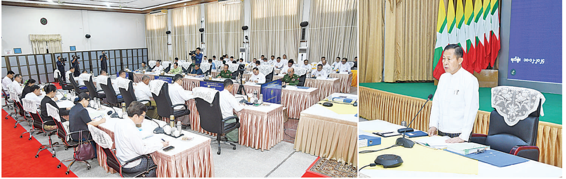
တရားမဝင်ကုန်သွယ်မှုတိုက်ဖျက်ရေးဦးဆောင်ကော်မတီဥက္ကဋ္ဌ နိုင်ငံတော်စီမံအုပ်ချုပ်ရေးကောင်စီဒုတိယဥက္ကဋ္ဌ ဒုတိယဝန်ကြီးချုပ် ဒုတိယဗိုလ်ချုပ်မှူးကြီးစိုးဝင်း တရားမဝင်ကုန်သွယ်မှုတိုက်ဖျက်ရေးဦးဆောင်ကော်မတီလုပ်ငန်းညှိနှိုင်းအစည်းအဝေး(၅/၂၀၂၄)တွင် အမှာစကားပြောကြားစဉ်။