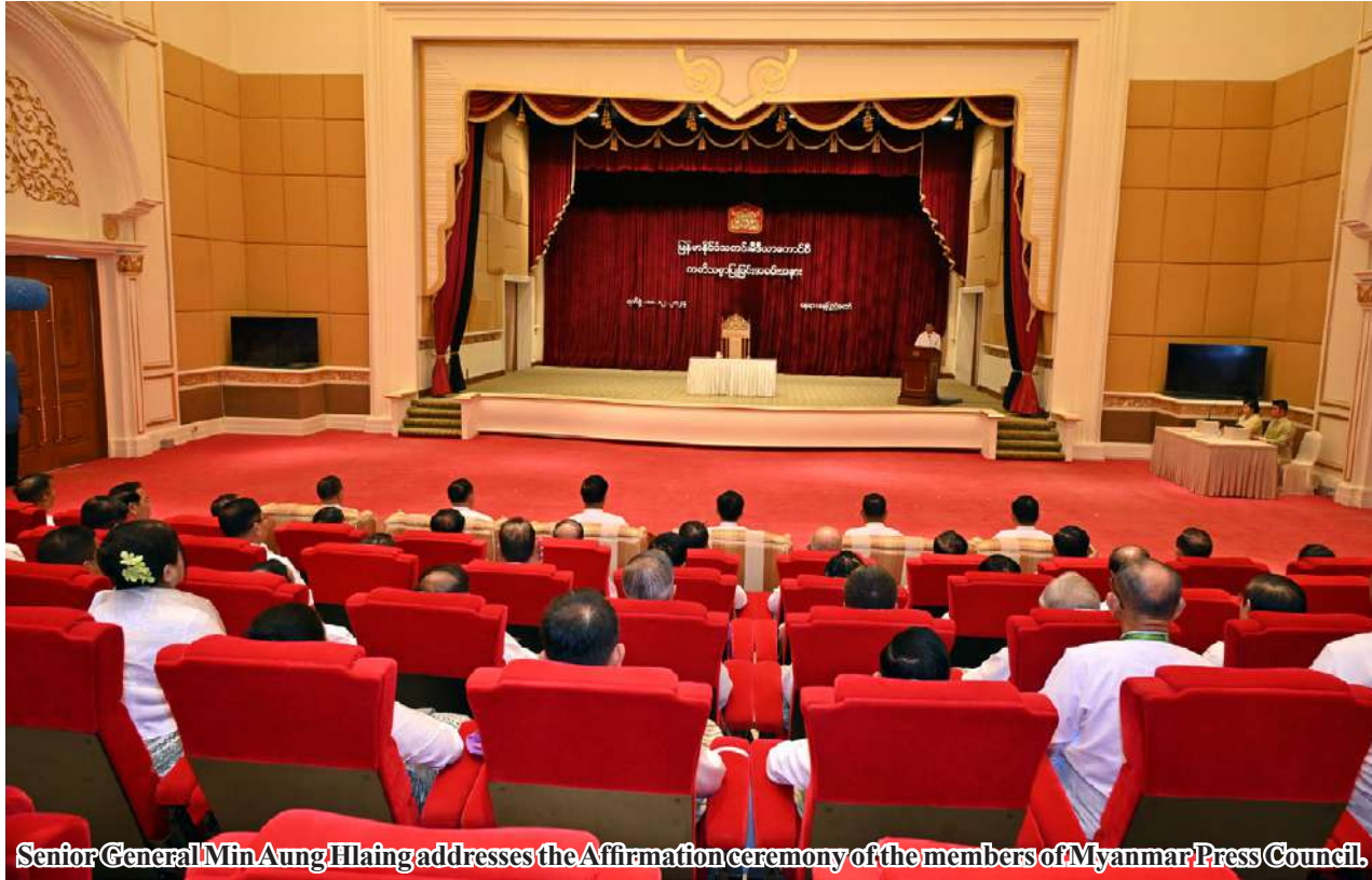
Senior General Min Aung Hlaing addresses the Affirmation ceremony of the members of Myanmar Press Council.