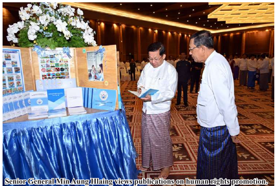
Senior General Min Aung Hlaing views publications on human rights promotion.

Attempts to deteriorate peace and stability in the country can be defined as destroying liberty and human rights of the entire national people. Armed terrorism violate human rights of ethnic people. Hence, all entire people are urged