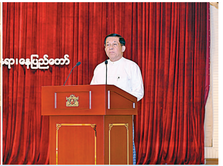
နိုင်ငံတော်စီမံအုပ်ချုပ်ရေးကောင်စီဥက္ကဋ္ဌ နိုင်ငံတော်ဝန်ကြီးချုပ် ဗိုလ်ချုပ်မှူးကြီးမင်းအောင်လှိုင် မြန်မာနိုင်ငံ သတင်းမီဒီယာကောင်စီဝင်များ ကတိသစ္စာပြုခြင်းအခမ်းအနားတွင် အမှာစကားပြောကြားစဉ်။

ကျောပိုးမှအဆက် တက်ရောက်အမှာစကားပြောကြားသည်။ အခမ်းအနားသို့ ကောင်စီအတွင်းရေးမှူး ဗိုလ်ချုပ်ကြီးအောင်လင်းခွေး၊ တွဲဖက်အတွင်းရေးမှူး ဗိုလ်ချုပ်ကြီးရဲဝင်းဦး၊ ကောင်စီအဖွဲ့ဝင်များ၊ ပြည်ထောင်စုအဆင့်ပုဂ္ဂိုလ်များနှင့် ပြည်ထောင်စုဝန်ကြီးများ၊ နေပြည်တော်ကောင်စီဥက္ကဋ္ဌ၊ ဒုတိယဝန်ကြီးများနှင့် တာဝန်ရှိသူများ၊ မြန်မာနိုင်ငံ သတင်းမီဒီယာကောင်စီဥက္ကဋ္ဌ ဒေါက်တာတင်ထွန်းဦး၊ ဒုတိယဥက္ကဋ္ဌများ၊ မြန်မာနိုင်ငံသတင်းမီဒီယာကောင်စီအဖွဲ့ဝင်များ၊ အတွင်းရေးမှူးနှင့် တွဲဖက်အတွင်းရေးမှူးများ တက်ရောက်ကြသည်။