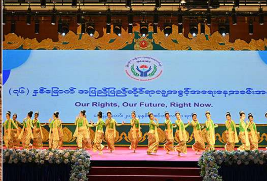
နိုင်ငံတော်စီမံအုပ်ချုပ်ရေးကောင်စီဥက္ကဋ္ဌ နိုင်ငံတော်ဝန်ကြီးချုပ် ဗိုလ်ချုပ်မှူးကြီးမင်းအောင်လှိုင်နှင့် အခမ်းအနားတက်ရောက်လာကြသူများက သာသနာရေးနှင့်ယဉ်ကျေးမှုဝန်ကြီးဌာန အနုပညာဦးစီးဌာနမှ အနုပညာရှင်များက လူ့အခွင့်အရေးကော်မရှင်သီချင်းဖြင့် သရုပ်ဖော်ကပြဖျော်ဖြေမှုကို ကြည့်ရှုအားပေးစဉ်။

၂၀ ရှေးဖွဲ့မှအဆက် လွတ်လပ်ရေးရပြီး ယင်းနှစ် ဒီဇင်ဘာ ၁၀ ရက်တွင် ကုလသမဂ္ဂအထွေထွေညီလာခံက အတည်ပြုထုတ်ပြန်ခဲ့သည့် ကမ္ဘာ့လူ့အခွင့်အရေး ကြေညာစာတမ်း (Universal Declaration of Human Rights)ကို အတည်ပြုနိုင်ရေး မြန်မာနိုင်ငံက ထောက်ခံပေးခဲ့ကြောင်း၊ ကမ္ဘာ့လူ့အခွင့်အရေးကြေညာစာတမ်းကို ၁၉၄၆ ခုနှစ်တွင် စတင်ရေးဆွဲခဲ့ကြပြီး နှစ်နှစ်အကြာ ၁၉၄၈ ခုနှစ် ဒီဇင်ဘာ ၁၀ ရက်၌ အတည်ပြုထုတ်ပြန်နိုင်ခဲ့ခြင်းဖြစ်ကြောင်း။ မိမိတို့မြန်မာနိုင်ငံသည် ကမ္ဘာ့လူ့အခွင့်အရေးကြေညာစာတမ်းကို ထောက်ခံအတည်ပြုခဲ့ရုံသာမက နိုင်ငံတော်၏ ဖွဲ့စည်းပုံအခြေခံဥပဒေတွင်လည်း နိုင်ငံသူ၊ နိုင်ငံသားများ၏ မူလအခွင့်အရေးနှင့် တာဝန်များကို ထည့်သွင်းဖော်ပြထား