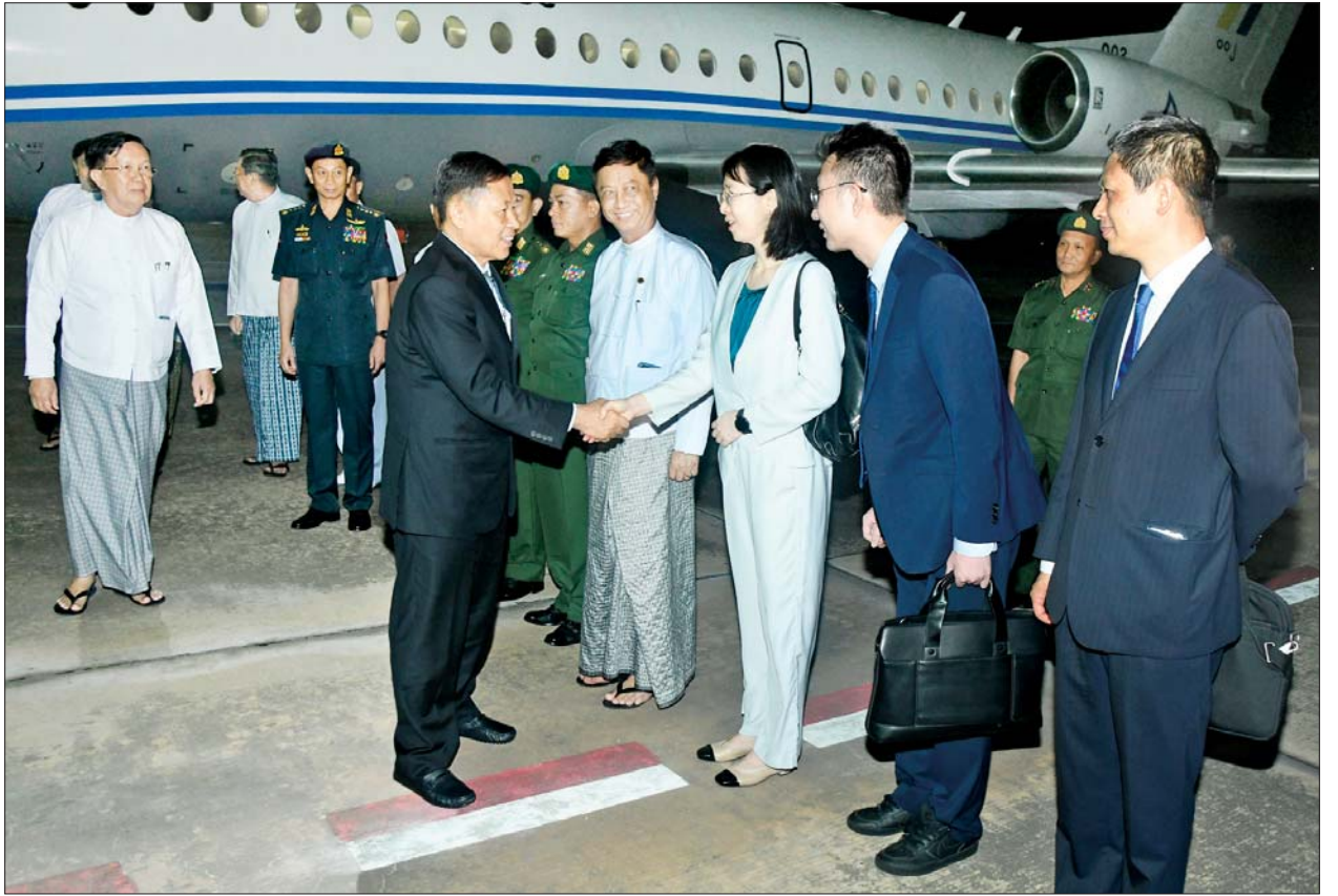
နိုင်ငံတော်စီမံအုပ်ချုပ်ရေးကောင်စီ ဒုတိယဥက္ကဋ္ဌ ဒုတိယဝန်ကြီးချုပ် ဒုတိယဗိုလ်ချုပ်မှူးကြီး စိုးဝင်းအား နိုင်ငံတော်စီမံအုပ်ချုပ်ရေးကောင်စီအတွင်းရေးမှူး ဒုတိယဗိုလ်ချုပ်ကြီး အောင်လင်းဒွေး၊ ကောင်စီအဖွဲ့ဝင်များ၊ မြန်မာနိုင်ငံဆိုင်ရာ တရုတ်နိုင်ငံသံရုံးနှင့် စစ်သံရုံးတို့မှ တာဝန်ရှိသူများက နေပြည်တော်လေဆိပ်၌ ကြိုဆိုနှုတ်ဆက်ကြစဉ်။

နိုင်ငံတော်စီမံအုပ်ချုပ်ရေးကောင်စီ ဒုတိယဥက္ကဋ္ဌ ဒုတိယဝန်ကြီးချုပ် ဦးဆောင်သော ကိုယ်စားလှယ်အဖွဲ့အား နိုင်ငံတော်စီမံအုပ်ချုပ်ရေးကောင်စီအတွင်းရေးမှူး ဒုတိယဗိုလ်ချုပ်ကြီး အောင်လင်းဒွေး၊ ကောင်စီအဖွဲ့ဝင်များ၊ ပြည်ထောင်စုဝန်ကြီးများ၊ ကာကွယ်ရေးဦးစီးချုပ်ရုံး (ကြည်း)မှ အဆင့်မြင့် တပ်မတော်အရာရှိကြီးများ၊ နေပြည်တော်တိုင်းစစ်ဌာနချုပ်တိုင်းမှူး၊ ဒုတိယဝန်ကြီးများနှင့် မြန်မာနိုင်ငံဆိုင်ရာ တရုတ်နိုင်ငံသံရုံးနှင့် စစ်သံရုံးတို့မှ တာဝန်ရှိသူများက နေပြည်တော်