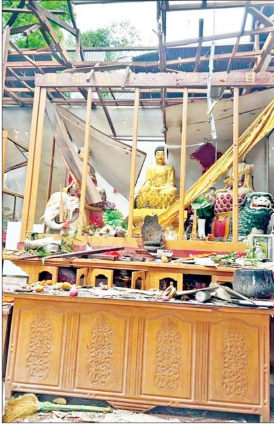
MNDA အကြမ်းဖက်သောင်းကျန်းသူများက လားရှိုးမြို့အတွင်းသို့ ရှေ့တိုက်ခိုးများ၊ Drop Bomb များဖြင့် ပစ်ခတ်တိုက်ခိုက်ခဲ့မှုကြောင့် တရုတ်ဖွဲ့စည်းတဲ့ကျောင်း ထိခိုက်ပျက်စီးနေမှုအား တွေ့ရစဉ်။

ကအထိ မိုင်းပေါက်ဒေသ၊ လောက်ကိုင် ဒေသ၊ တာချီလိတ်ဒေသ၊ မူဆယ်ဒေသ၊ မြဝတီ(ရွှေကုက္ကိုလ်၊ KK Park) တို့ကနေ ဖော်ထုတ် ဖမ်းဆီးရမိခဲ့တဲ့ တရုတ် နိုင်ငံသား ၅၁၈၅ ဦး၊ ဗီယက်နမ် နိုင်ငံသား ၁၁၄၃ ဦး၊ ထိုင်းနိုင်ငံသား ၆၄၀ အပါအဝင် ၂၁၅၀ ကို သက်ဆိုင်ရာ နိုင်ငံတွေကို လွှဲပြောင်းပေးနိုင်ခဲ့ပါတယ်။ နောက်ပိုင်းမှာ MNDA ဟာ ကိုးကန့် နယ်မြေ အထူးဒေသ(၁)ရရှိရေးဆိုပြီး လုပ်ဆောင်လာပါတယ်။ အကြမ်းဖက် NUG အဖွဲ့နဲ့ တွေ့ဆုံပြီး သူတို့နယ်မြေကို လိုက်ပြတာတွေ၊ ဆွေးနွေးတာတွေ လုပ်လာတဲ့အပြင် ကိုးကန့်ဒေသရဲ့ ပြင်ပ ကိုပါဆက်လက်နယ်မြေချဲ့ထွင် တိုက်ခိုက် လာတာတွေရပါတယ်။ NUG အဖွဲ့ရဲ့ အသံ ကိုလိုက်ပြီး ပြောကြားနေတာကိုလည်း တွေ့ရပါတယ်။ ကိုးကန့်နယ်မြေထဲက ကလေးငယ်တွေပါမကျန်လှသစ်ဆောင်း တာတွေ၊ ကိုးကန့်ဒေသအတွင်းမှာ အလုပ်လုပ်ကိုင်ခဲ့ကြတဲ့ ဗမာအပါအဝင်