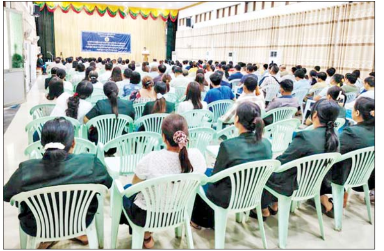
ဆွေးနွေးပြီး တက်ရောက်လာသော အခွန် ထမ်းပြည်သူများက သိလိုသည်များကို မေးမြန်းဆွေးနွေးကြသည်။ ယင်းနောက် တိုင်းဒေသကြီး စီးပွား ရေးရာဝန်ကြီး ဦးတင်ဦးက နိဂုံးချုပ် အမှာစကား ပြောကြားခဲ့ကြောင်း သိရ သည်။ ကိုတွတ် (ပြန်/ဆက်)

ဆိုင်များတွင်လည်း ပြေစာတောင်းယူ နိုင်ရန်အတွက် စားသုံးသူမိတ်ဆက်ပေးမှုများ သို့ အသိပေးနှိုးဆော်စာ ကြော်ငြာပို့နှိပ် များ ကပ်ထားပြီးဖြစ်ကြောင်း၊ ပြေစာ ရရှိသော်လည်း အခွန်အမှတ်တံဆိပ် ကပ်နှိပ်ထားမှုမရှိခြင်း၊ ကျသင့်အခွန်နှင့် ညီမျှသော အခွန်အမှတ်တံဆိပ်ကပ် နှိပ်ထားမှုမရှိခြင်းများ တွေ့ရှိပါက အထောက်အထားနှင့်အတူ နီးစပ်ရာ အခွန်ရုံးသို့ တိုင်ကြားနိုင်ကြောင်း ပြောကြားသည်။ ဆက်လက်၍ တိုင်းဒေသကြီး ပြည်တွင်းအခွန်များဦးစီးဌာန ညွှန်ကြား ရေးမှူး ဦးကျော်ဟိုးလှိုင်က အခွန်ဆိုင်ရာ သိမှတ်ဖွယ်ရာများအကြောင်း ရှင်းလင်း