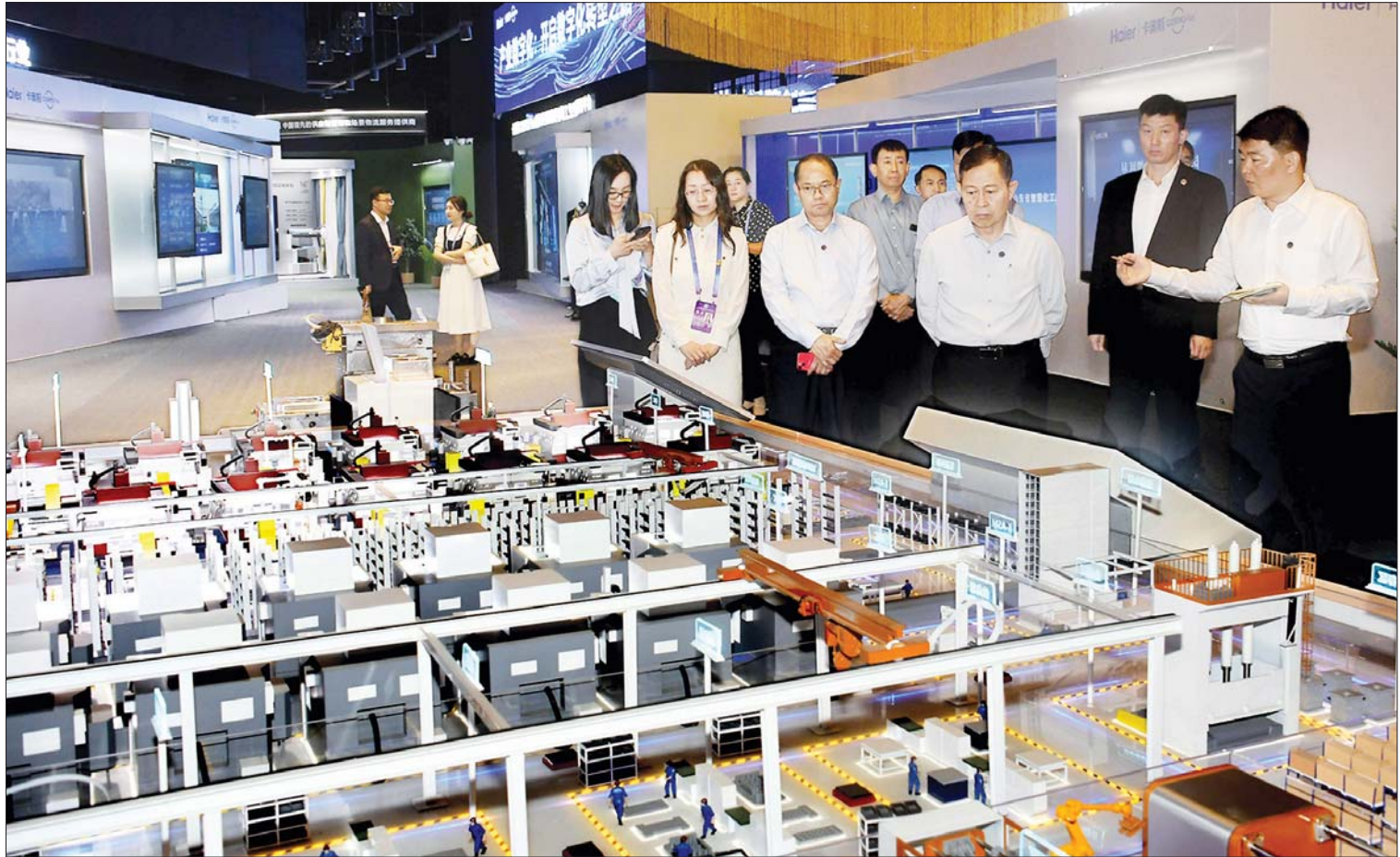
နိုင်ငံတော်စီမံအုပ်ချုပ်ရေးကောင်စီ ဒုတိယဥက္ကဋ္ဌ ဒုတိယဝန်ကြီးချုပ် ဒုတိယဗိုလ်ချုပ်မှူးကြီးစိုးဝင်း ချင်းတောင်မြို့ရှိ ချင်းတောင် ဟိုင်အယ်အဖွဲ့အတွင်း ကြည့်ရှုလေ့လာစဉ်။

နေပြည်တော် ဇူလိုင် ၉ တရုတ်ပြည်သူ့သမ္မတ နိုင်ငံ ချင်းတောင်မြို့၌ ရောက်ရှိနေသည့် နိုင်ငံ တော်စီမံအုပ်ချုပ်ရေးကောင်စီ ဒုတိယ ဥက္ကဋ္ဌ ဒုတိယဝန်ကြီးချုပ် ဒုတိယ ဗိုလ်ချုပ်မှူးကြီးစိုးဝင်း ဦးဆောင်သော မြန်မာကိုယ်စားလှယ်အဖွဲ့သည် ယနေ့ နံနက်ပိုင်းတွင် ချင်းတောင်မြို့အတွင်းရှိ ချင်းတောင် ဟိုင်အယ်အဖွဲ့ (Qingdao Haier Group)နှင့် ချင်းတောင်သုတေသန နှင့် ဖွံ့ဖြိုးတိုးတက်မှုစင်တာ (Qingdao Hisense Research and Development Center)များသို့ လှည့်လည်ကြည့်ရှု လေ့လာကြသည်။