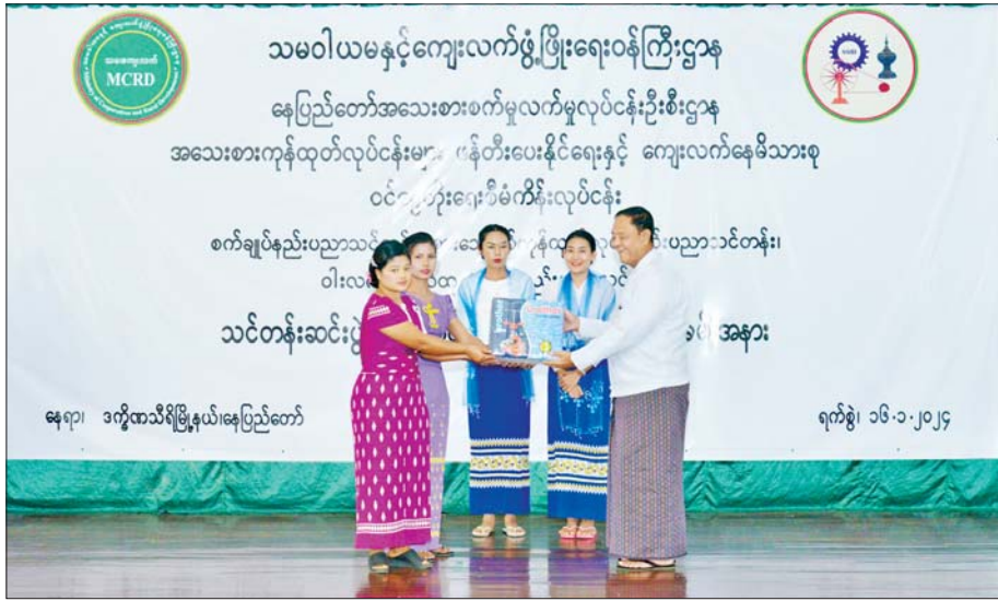
ပြည်ထောင်စုဝန်ကြီး ဦးလှမိုး သင်တန်းဆင်းလုပ်ငန်းထူထောင်မည့်သူတစ်ဦးအား လုပ်ငန်းသုံး ပစ္စည်းများ ထောက်ပံ့ပေးစဉ်။

၂၀၂၃-၂၀၂၄ ဘဏ္ဍာနှစ်တွင် စီမံကိန်းကျေးရွာ ၁၅၁ ရွာကို ရွေးချယ်၍ ရှေ့ပြေးစမ်းသပ်ခြင်း Pilot Project အဖြစ် ဆောင်ရွက်ခဲ့ပါသည်။ ယခု ၂၀၂၄-၂၀၂၅ ဘဏ္ဍာနှစ်တွင် စီမံကိန်းကျေးရွာ ၂၁၂ ရွာ