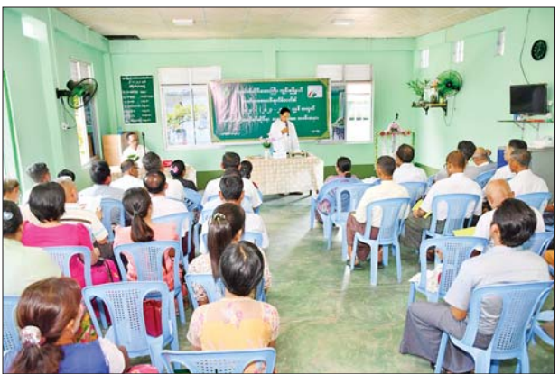
ကျွန်းစုမြို့နယ် သမဝါယမအသင်းစု၏ နှစ်ပတ်လည်အစည်းအဝေး ကျင်းပ