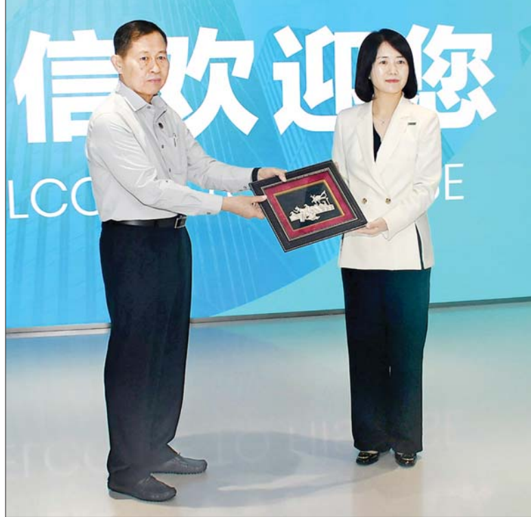
နိုင်ငံတော်စီမံအုပ်ချုပ်ရေးကောင်စီ ဒုတိယဥက္ကဋ္ဌ ဒုတိယဝန်ကြီးချုပ် ဒုတိယဗိုလ်ချုပ်မှူးကြီးစိုးဝင်းနှင့် Hisense ချင်းတောင် သုတေသနနှင့် ဖွံ့ဖြိုးတိုးတက်မှုစင်တာမှ တာဝန်ရှိသူတစ်ဦးတို့ လက်ဆောင်ပစ္စည်းများ အပြန်အလှန်ပေးအပ်စဉ်။