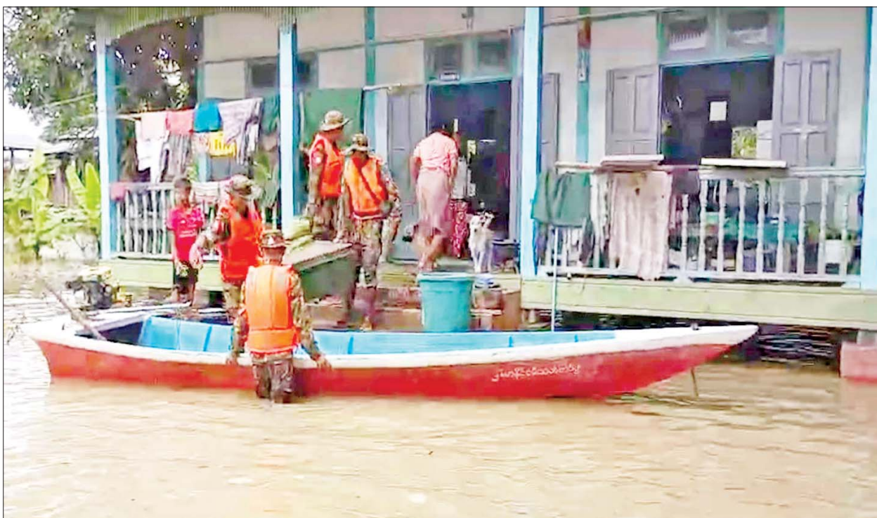
မော်လိုက်မြို့နယ်အတွင်းရှိ ရပ်ကွက်၊ ကျေးရွာများမှ ရေဘေးသင့်ပြည်သူများအား နယ်မြေခံတပ်မတော်သားများက ကူညီရွှေ့ပြောင်းပေးစဉ်။

စစ်ကိုင်းတိုင်းဒေသကြီးအတွင်း၌ မိုးသည်းထန်စွာ ရွာသွန်းမှုကြောင့် ချင်းတွင်းမြစ်ရေမြင့်တက်ကာ ခန္တီးမြို့နယ်နှင့် မော်လိုက်မြို့နယ်တို့အတွင်းရှိ ရပ်ကွက်၊ ကျေးရွာများအတွင်း၌ မြစ်ရေဝင်ရောက်မှုများဖြစ်ပေါ်လျက်ရှိပြီး ရေဘေးသင့်ပြည်သူများအား ကူညီကယ်ဆယ်ရေးလုပ်ငန်းများ ဆောင်ရွက်ပေးလျက်ရှိပါသည်။ ထိုသို့ဆောင်ရွက်ပေးလျက်ရှိရာ ယနေ့တွင် နယ်မြေခံတပ်မတော်သားများနှင့် ဌာနဆိုင်ရာတာဝန်ရှိသူများက မော်လိုက်မြို့နယ်ကျောက်တောင်ရပ်ကွက်၊ တံတားဦးရပ်ကွက်၊ ကျောက်မြောင်းရပ်ကွက်၊ အောင်မင်္ဂလာရပ်ကွက်၊ သရက်ကုန်းရပ်ကွက်၊ စွယ်တော်ရပ်ကွက်၊ ညောင်ပင်သာရပ်ကွက်၊ တွန်းပင်ကျေးရွာနှင့် တိန်းသာကျေးရွာတို့ရှိ ရေဘေးသင့်ပြည်သူများအား ရေဘေးလွတ်ရာ ကယ်ဆယ်ရေးစခန်းများသို့ ကူညီရွှေ့ပြောင်းခြင်းလုပ်ငန်းများ ဆောင်ရွက်ပေးလျက်ရှိပြီး လိုအပ်သည့် ကျန်းမာရေးစောင့်ရှောက်မှုလုပ်ငန်းများ ဆောင်ရွက်ပေးကာ စားသောက်ဖွယ်ရာများ ထောက်ပံ့ပေးအပ်ခဲ့ကြောင်း သိရပါသည်။