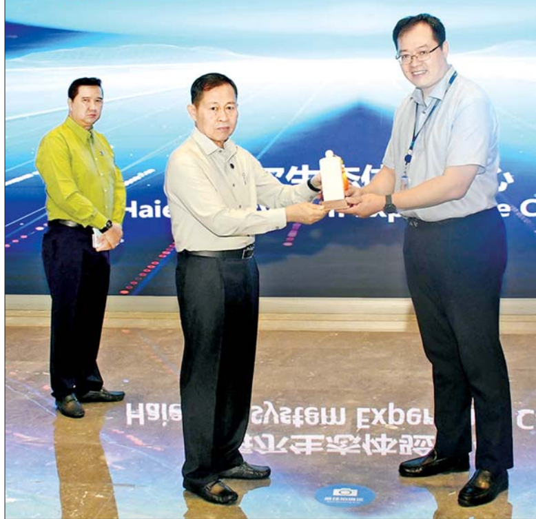
နိုင်ငံတော်စီမံအုပ်ချုပ်ရေးကောင်စီ ဒုတိယဥက္ကဋ္ဌ ဒုတိယဝန်ကြီးချုပ် ဒုတိယဗိုလ်ချုပ်မှူးကြီးစိုးဝင်းနှင့် ချင်းတောင်မြို့ ချင်းတောင် ဟိုင်အယ်အဖွဲ့မှ တာဝန်ရှိသူ တစ်ဦးတို့ လက်ဆောင်ပစ္စည်းများ အပြန်အလှန်ပေးအပ်စဉ်။

နေ့လယ်စာစားပွဲသို့ တက်ရောက် ဆက်လက်၍ နိုင်ငံတော်စီမံအုပ်ချုပ်ရေးကောင်စီ ဒုတိယဥက္ကဋ္ဌ ဒုတိယဝန်ကြီးချုပ် ဦးဆောင်သော မြန်မာကိုယ်စားလှယ်အဖွဲ့သည် ချင်းတောင်မြို့ မြို့တော်ဝန် Mr. Zhao Haozhi က Qingdao Sea View Garden Hotel ၌ တည်ခင်းဧည့်ခံသည့် နေ့လယ်စာစားပွဲသို့ တက်ရောက်ခဲ့ကြောင်း သိရသည်။