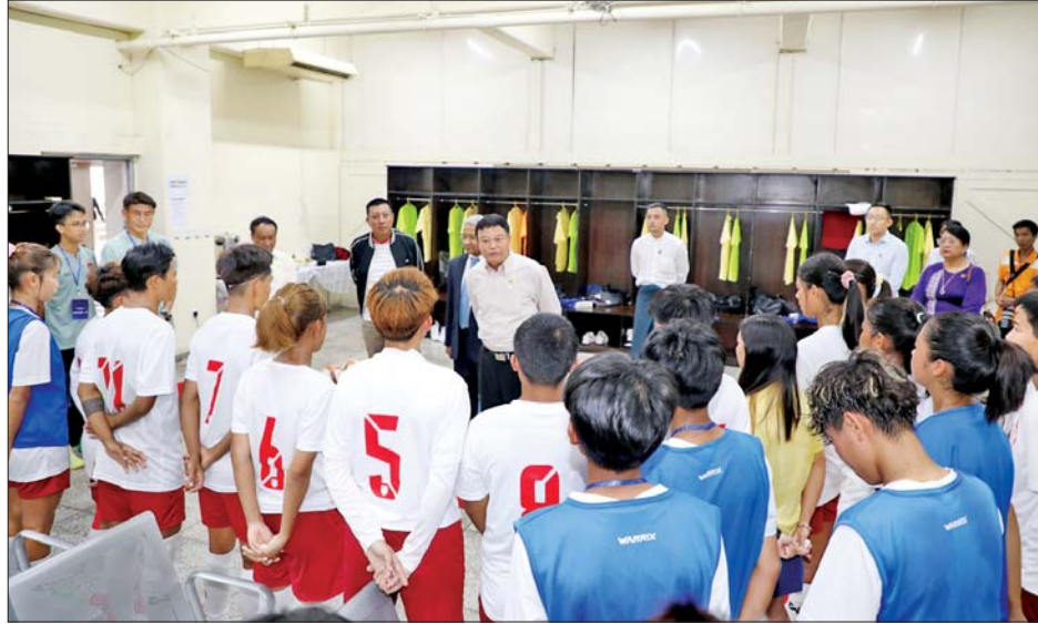
နေပြည်တော်တို့မှ သင်တန်းသား သင်တန်းသူ ၂၅၄ဦး သည် မျိုးဆက်သစ်အားကစားသမားများ ပေါ်ထွက် ကို နိုင်ငံတော်က အလုံးစုံအကူအညီအားထားရ လာအောင် လေ့ကျင့်သင်ကြားပေးလျက်ရှိသည်။

အဆိုပါ အားကစားနှင့်ကာယပညာသိပ္ပံ (ရန်ကုန်) တွင် အားကစားနည်း ၁၇ နည်းကို လေ့ကျင့်သင်ကြား ပေးလျက်ရှိပြီး ရန်ကုန်၊ ပဲခူး၊ ဧရာဝတီ၊ ရခိုင်နှင့်