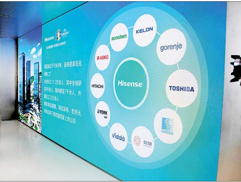
နိုင်ငံတော်စီမံအုပ်ချုပ်ရေးကောင်စီ ဒုတိယဥက္ကဋ္ဌ ဒုတိယဝန်ကြီးချုပ် ဒုတိယဗိုလ်ချုပ်မှူးကြီးစိုးဝင်း Hisense ချင်းတောင် သုတေသနနှင့် ဖွံ့ဖြိုးတိုးတက်မှု စင်တာအတွင်း ကြည့်ရှုလေ့လာစဉ်။

နှင့် ဒစ်ဂျစ်တယ်အသွင်ပြောင်းလဲမှုတို့အတွက် ကမ္ဘာ့ထိပ်တန်း ဖြေရှင်းမှုများကို ထောက်ပံ့ပေးလျက်ရှိသည်။ ဟိုင်အယ်အဖွဲ့သည် ခေတ်ဆန်သော လူနေမှုနှင့် စက်မှုလုပ်ငန်းသုံး အင်တာနက်စသည့် အဓိကလမ်းကြောင်း နှစ်ခုကို တည်ထောင်ထားပြီး သုတေသနနှင့် ဖွံ့ဖြိုးတိုးတက်မှုစင်တာ ၁၀ ခု၊ သုတေသနအဖွဲ့အစည်း ၇၁ ဖွဲ့၊ စက်မှုဥယျာဉ် ၃၅ ခု၊ ကုန်ထုတ်လုပ်မှုစင်တာ ၁၄၃ ခုနှင့် ကမ္ဘာတစ်ဝန်းတွင် အရောင်းကွန်ရက်ပေါင်း ၂၃၀၀၀၀ ကို တည်ထောင်ထားကြောင်း သိရသည်။