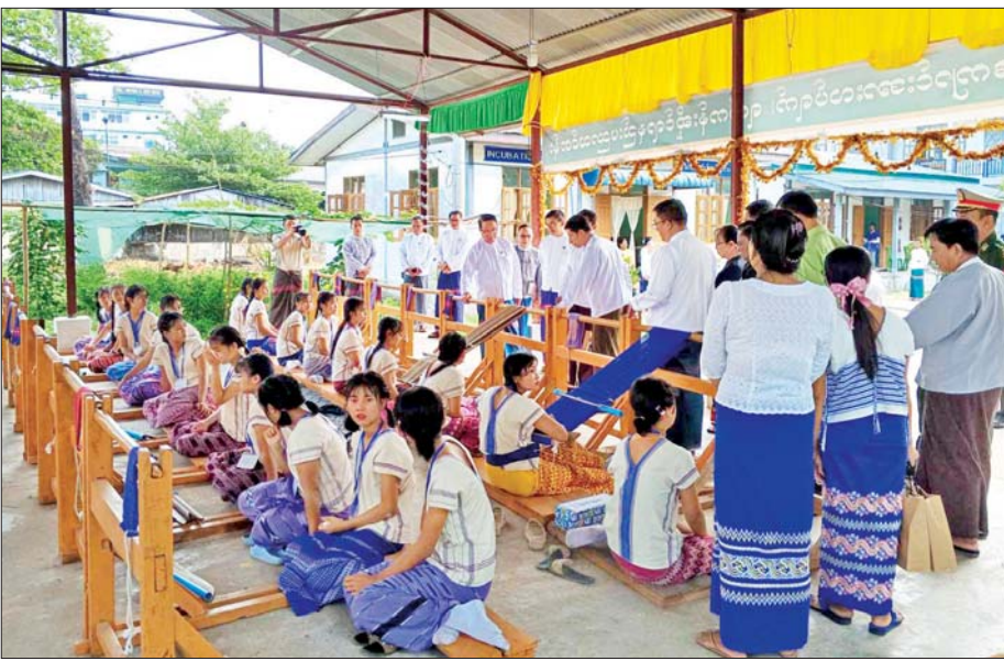
ကရင်ပြည်နယ်၌ ဝင်ငွေတိုးစီမံကိန်းဖြင့် ဂျပန်အကူအညီကုန်သွယ်ရေးနှင့်လုပ်ငန်းဖွင့်လှစ်ပေးမှုကို ပြည်နယ် ဝန်ကြီးချုပ် ဦးစောမြင့်ဦး လာရောက်အားပေးစဉ်။

ဘိန်းစိုက်ပျိုးသည့်မြို့နယ်များတွင် အစားထိုး အသေးစား ကုန်ထုတ်လုပ်ငန်းများဖွံ့ဖြိုးရေး ဆောင်ရွက်မည့်လုပ်ငန်းမှာ နိုင်ငံတော်အဆင့်အနေ ဖြင့် မြန်မာနိုင်ငံမူးယစ်တားဆီးကာကွယ်ရေး ဗဟိုအဖွဲ့ကွပ်ကဲမှုအောက်တွင် အဖွဲ့များဖွဲ့စည်း၍ ဆောင်ရွက်လျက်ရှိရာ အသေးစား စက်မှုလက်မှု လုပ်ငန်းဦးစီးဌာနသည် အစားထိုးဖွံ့ဖြိုးမှုအကောင် အထည်ဖော်ရေး စီမံခန့်ခွဲမှုအဖွဲ့တွင် အဖွဲ့ဝင် အဖြစ်ပါဝင်သည့်အတွက် ဌာနအနေဖြင့် ဘိန်းစိုက် တောင်သူများအတွက် အခြေခံဝန်ဆောင်မှုများ၊ အစားထိုးဖွံ့ဖြိုးရေးလုပ်ငန်းများ ဆောင်ရွက်ပေး ခြင်းဖြင့် တရားမဝင်ဘိန်းစိုက်ပျိုးမှုကို တစ်စတစ်စ လျော့ချသွားရမည်ဖြစ်ပါသည်။ ဘိန်းစိုက်ပျိုးသည့် မြို့နယ် ၅၅ မြို့နယ်ရှိ ဒေသခံပြည်သူများ စီးပွားရေး အခွင့်အလမ်း ပိုမိုရရှိစေရန်အတွက် ဒေသနှင့် သင့်လျော်သည့် အသက်မွေးဝမ်းကျောင်းသင်တန်း များကို ဖွင့်လှစ်ပေးပြီး သင်တန်းဆင်းပြီးသူများအား လုပ်ငန်းထူထောင်နိုင်ရန် လိုအပ်သောကုန်ကြမ်းများ နှင့် စက်ပစ္စည်းများကို ထောက်ပံ့ပေးခြင်းဖြစ်ပါသည်။