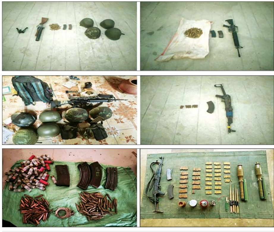
ကျွန်း - ကော့ကရိတ်ဒေသ တိုက်ပွဲဖြစ်ပွားမှုတွင် သိမ်းဆည်းရရှိသည့် လက်နက်၊ ခဲယမ်းနှင့် ဆက်စပ်ပစ္စည်းများ မှတ်တမ်း။

ဧပြီ ၂၂ ရက်တွင် တပ်မတော်မှ အဆိုပါဒေသအား ပြန်လည်ထိန်းချုပ်နိုင်ခဲ့ပြီး အကြမ်းဖက်သောင်းကျန်းသူများသည် ကော့ကရိတ်မြို့၏ မြောက်ဘက်ရှိ ကောင်းမွန်ကျေးရွာဘက်သို့ လာရာလမ်းကြောင်းအတိုင်း ဖရိုဖရဲပြန်လည်ဆုတ်ခွာ ထွက်ပြေးသွားခဲ့သည်။ အဆိုပါ တိုက်ပွဲများတွင် အကြမ်းဖက်သောင်းကျန်းသူများထံမှ အလောင်းအချို့၊ လက်နက်၊ ခဲယမ်းများနှင့် ဆက်စပ်ပစ္စည်းများ သိမ်းဆည်းရရှိခဲ့ပြီး မိမိဘက်မှ အရာရှိ၊ စစ်သည်အချို့ ထိခိုက်ဒဏ်ရာရရှိခဲ့သည်။ တပ်မတော် စစ်ကြောင်းများအနေဖြင့် ဆုတ်ခွာထွက်ပြေးသွားခဲ့သည့် အကြမ်းဖက်သောင်းကျန်းသူများအား ထက်ကြပ်လိုက်လံချေမှုန်း တိုက်ခိုက်လျက်ရှိပြီး ကော့ကရိတ်မြို့အတွင်း ပျက်စီးခဲ့သည့် အပျက်အစီးများအား ပြန်လည်ထူထောင်ရေးလုပ်ငန်းများ ဆောင်ရွက်ခြင်းနှင့် ဒေသခံပြည်သူများ အန္တရာယ်ကင်းရှင်းစေရန်အတွက် မိုင်းရှင်းလင်းရေးလုပ်ငန်းများ ဆက်လက်ဆောင်ရွက်ပေးလျက်ရှိသည်။ ထို့အပြင်