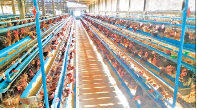
ဟိုပုံးမြို့နယ် ကျောက်တန်းကျေးရွာ ဥစားကြက်မွေးမြူရေးလုပ်ငန်း။