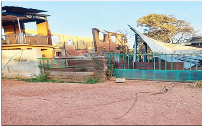
အကြမ်းဖက်သမားများ၏ မီးရှို့ဖျက်ဆီးမှုကြောင့် ကော့ကရိတ်မြို့ အမှတ်(၅)ရပ်ကွက် မီးလောင်ပျက်စီးမှု မှတ်တမ်းဓာတ်ပုံ။