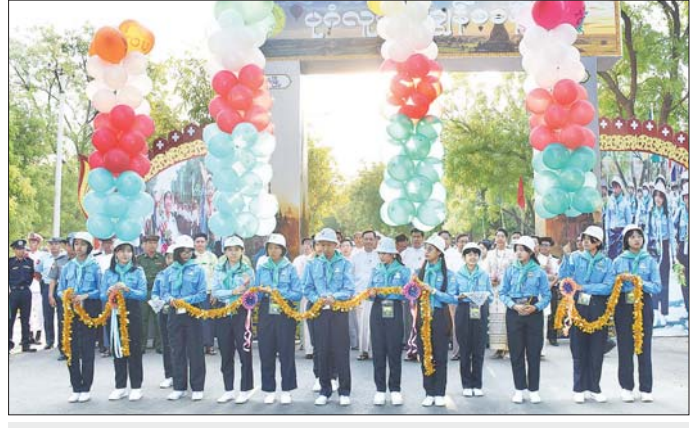
ပုဂံလူရည်ချွန်စခန်းအား လူရည်ချွန်ကျောင်းသားကျောင်းသူတို့က ဖဲကြိုးဖြတ် ဖွင့်လှစ်ပေးစဉ်။