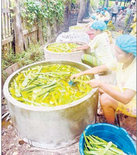
ရှားစောင်းလက်ပပ်ကုန်ကြမ်းများကို ဆေးကြောသန့်စင်နေစဉ်။

မေး ။ ။ အခုလို မြန်မာတိုင်းရင်းဆေးကို ထုတ်လုပ်ပြီးတော့ ဈေးကွက်ရရှိအောင် ဆောင်ရွက်ခဲ့တာနဲ့ ပတ်သက်ပြီး