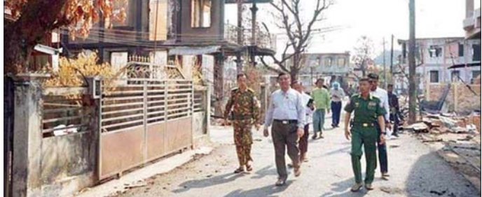
ပြည်နယ်ဝန်ကြီးချုပ် ဦးအောင်ကြည်သိန်းနှင့် တာဝန်ရှိသူများက မဗ္ဗသတ်ကျေးရွာအတွင်း အကြမ်းဖက်သောင်းကျန်းသူများ မီးရှို့ဖျက်ဆီးခဲ့မှုကြောင့် ပျက်စီးသွားသော နေအိမ်အဆောက်အအုံများအား လိုက်လံကြည့်ရှုစဉ်။

ကော့ဘိန်းကျေးရွာများသို့ အမျိုးသား ၂၆ ဦး၊ အမျိုးသမီး ၁၂၄ ဦး စုစုပေါင်း ၂၅၀ နှင့် ကရင်ပြည်နယ် ကော့ဘိန်း ကျေးရွာသို့ အမျိုးသား ၁၆၁ ဦး၊ အမျိုးသမီး ၃၂၄ ဦး စုစုပေါင်း ၄၈၅ ဦးတို့ ပြန်လည်ဝင်ရောက်နေထိုင်လာကြောင်း သိရသည်။ အဆိုပါ ပြန်လည်ဝင်ရောက်လာသူများအား သက်ဆိုင်ရာတာဝန်ရှိသူများက နေ့ညမပြတ် ပြန်လည်ကြိုဆို၍ စနစ်တကျလက်ခံလျက်ရှိပြီး လိုအပ်သည့် ကူညီစောင့်ရှောက်ရေးလုပ်ငန်းများနှင့် ကျန်းမာရေးစောင့်ရှောက်မှုများ ဆောင်ရွက်ပေးလျက်ရှိသည်။ ထို့အပြင် မွန်ပြည်နယ်ဝန်ကြီးချုပ်နှင့် တာဝန်ရှိသူများက ပြန်လည်ဝင်ရောက်လာသည့် ဒေသခံပြည်သူများအား သွားရောက်တွေ့ဆုံ၍ အားပေးစကားပြောကြားပြီး စားသောက်ဖွယ်ရာပစ္စည်းများနှင့် လိုအပ်သည့် ထောက်ပံ့ပစ္စည်းများ ထောက်ပံ့ပေးအပ်ခဲ့ကြောင်း (အပေါ်ပုံ) နှင့် ယာယီနေရပ်စွန့်ခွာနေရသော ဒေသခံပြည်သူများသည် ၎င်းတို့၏နေရပ်အသီးသီးသို့ ဆက်လက်ဝင်ရောက်နေထိုင်လျက်ရှိကြောင်း သတင်းရရှိသည်။ သတင်းစဉ်