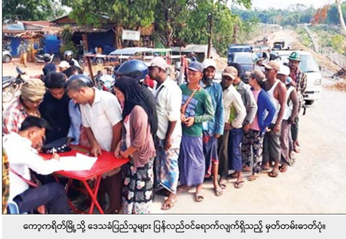
ကော့ကရိတ်မြို့သို့ ဒေသခံပြည်သူများ ပြန်လည်ဝင်ရောက်လျက်ရှိသည့် မှတ်တမ်းဓာတ်ပုံ။