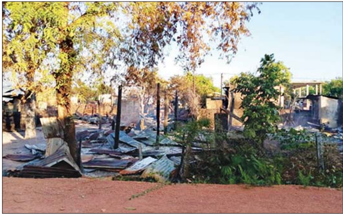
အကြမ်းဖက်သမားများ၏ မီးရှို့ဖျက်ဆီးမှုကြောင့် ကော့ကရိတ်မြို့ အမှတ်(၅)ရပ်ကွက် မီးလောင်ပျက်စီးမှု မှတ်တမ်းဓာတ်ပုံ။