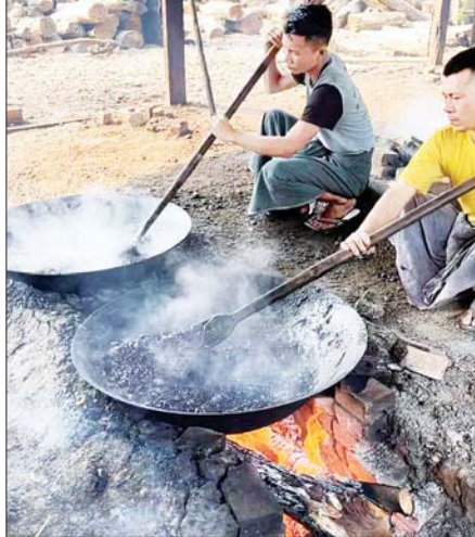
ရှားစောင်းလက်ပပ်များကိုချက်ဆေးခြင်းဖြစ် ကျိုချက်ထုတ်လုပ်နေစဉ်။

ဖြေ ။ ။ အဓိကကုန်ကြမ်းဖြစ်တဲ့ ရှားစောင်းလက်ပပ်ဆီတာ ကျွန်မတို့အညာဒေသမှာ ဖြစ်ထွန်းပါတယ်။ ပြောရမယ်ဆို