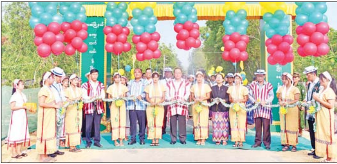
အချိန်တိုအတွင်း သွားလာနိုင်မည်ဖြစ်ပြီး လမ်းပန်းဆက်သွယ်ရေးအဆင်ပြေချောမွေ့စေကာ ကရင်ပြည်နယ်၏ ခရီးသွားလုပ်ငန်းများကို ဖွံ့ဖြိုးတိုးတက်လာစေမည်ဖြစ်ကြောင်း၊ ကရင်ပြည်နယ် ဖွံ့ဖြိုးတိုးတက်ရေးအတွက် အခြေခံအဆောက်အအုံများဖြစ်သော လမ်းပံ့တားများ တည်ဆောက်ရာတွင် အတူတကွ ပူးပေါင်းပါဝင်ကူညီပေးကြရန်နှင့် ရေရှည်တည်တံ့ခိုင်မြဲအောင် စီစဉ်ပေးမည်ဖြစ်ကြောင်း ပြောကြားခဲ့သည်။

ဘားအံ ဧပြီ ၂၈ ၂၀၂၄ ခုနှစ် မေလ ၁ ရက်နေ့တွင် ကျောက်မည် အလုပ်သမားနေ့ကို ကြိုဆိုဂုဏ်ပြုသောအားဖြင့် ဘားအံမြို့နယ်၏ အဓိကကျေးရွာချင်းဆက်လမ်း များဖြစ်သော မဲဘောင်-နောင်ပလိန်လမ်း၊ ရေကျော်-လှိုင်းပုံ - လှာကမြင်လမ်းနှင့် ကော့ကသောင် - လက္ခဏာလမ်းတို့ကို ကွန်ရက်သဖွယ် ချိတ်ဆက်ပေးထားသည့် လှိုင်းပုံ - လှိုင်းဝါး - လက္ခဏာလမ်း ကွန်ရက်လမ်းသစ်ဖွင့်ပွဲကို ဧပြီ ၂၆ ရက် နံနက် ၈ နာရီခန့်ကျော်အချိန်တွင် လှိုင်းပုံကျေးရွာရှိ အဆိုပါလမ်းသစ်ဖွင့်ပွဲတော်နေ့မှာ ကျင်းပခဲ့ပါသည်။