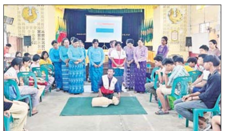
ပဲခူးမြို့၌ နွေရာသီကင်းထောက်လှူငွေသင်တန်းဖွင့်လှစ်သင်ကြားနေမှု သွားရောက်ကြည့်ရှုအားပေး