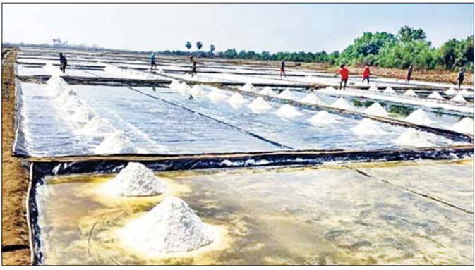
ငပတောမြို့နယ် မကျည်းပင်ကျေးရွာ နေလှန်းဆားထုတ်လုပ်ခြင်းလုပ်ငန်း။

“စိုက်ပျိုးရေး၊ မွေးမြူရေးဆိုတာက ကျေးရွာအစုအဖွဲ့တိုင်း ဆောင်ရွက်တဲ့ အသက်မွေးတဲ့ လုပ်ငန်းပါ။ ဒီလုပ်ငန်းတွေအပြင် ရွာရဲ့လူမှုစီးပွားတိုးတက်ဖို့ အပိုင်ငွေရ လုပ်ငန်းအဖြစ် ကွန်ကရစ်တုံး ထုတ်လုပ်ရောင်းချကြတယ်။ ဒီလို အပိုင်ငွေရ လုပ်ငန်းလုပ်နိုင်ဖို့ဆိုတာ ငွေကြေးအရင်းအနှီးက အရေးကြီးပါတယ်။ ဒီအရင်းအနှီးကို ကျေးလက်ဒေသဖွံ့ဖြိုးတိုးတက်ရေးဦးစီးဌာနက အထောက်အပံ့ပေးပါတယ်” ဟု မင်းဒေဝ်ကျေးရွာနေ ကွန်ကရစ်လုပ်ငန်းဆောင်ရွက်သည့်အဖွဲ့မှ ထုတ်လုပ်ရေးတာဝန်ခံတစ်ဦးမှ ပြောသည်။