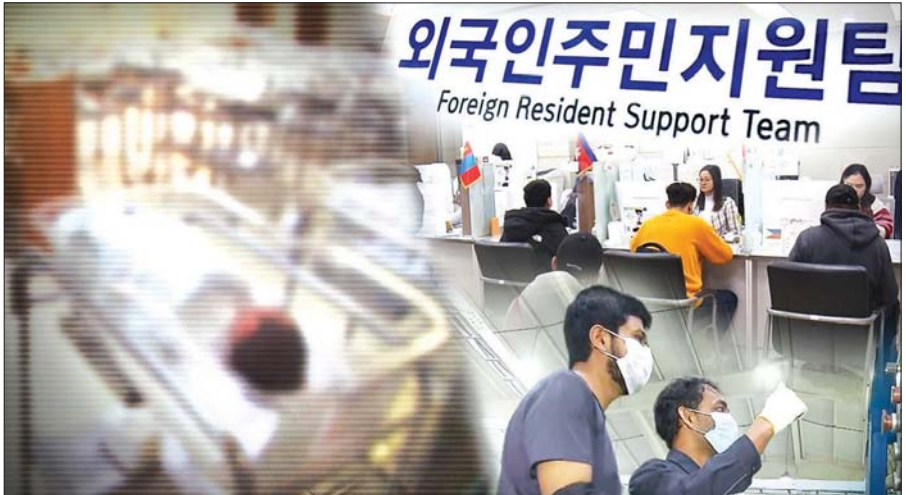
တောင်ကိုရီးယားနိုင်ငံမှ ပြည်ပအလုပ်သမားများအား နှစ်သိမ့်အကြံပေးမှုများ လုပ်ဆောင်ပေးသည့် အသင်းတစ်ခု။

ထို့ကြောင့် လွန်ခဲ့သော နှစ်ပေါင်း ၂၀ ခန့်ကတည်းက တောင်ကိုရီးယား နိုင်ငံသည် နိုင်ငံခြားသားများကို အလုပ်သမားများအဖြစ် လက်ခံသည့် စနစ်တစ်ခုကို စတင်ခဲ့ရသည်။ နိုင်ငံခြားသား အလုပ်သမား အရေအတွက်သည် အဓိကအားဖြင့် စက်မှုလုပ်ငန်းများနှင့် ကုန်ထုတ်လုပ်ရေးလုပ်ငန်းများတွင် သိသိသာသာ မြင့်တက်လာခဲ့သည်။ အဆိုပါ ကဏ္ဍနှစ်ခုတွင် လုပ်သားပြတ်လပ်မှုများလည်း