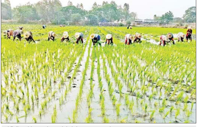
ပွင့်ဖြူမြို့နယ်၌ ယခုနှစ် နွေစပါးစိုက်ပျိုးနေသော တောင်သူများ။

❖ မိမိတို့နိုင်ငံရှိ တောင်သူလယ်သမားအများစုသည် စိုက်ကွက်ငယ်များကို အများစု ပိုင်ဆိုင် ကြပြီး မိရိုးဖလာစိုက်နည်းစနစ်များကိုသာ စားမဦးချ လုပ်ကိုင်နေကြသည်။ ဝမ်းစာပိုလျှိုး အလှူအတန်း လုပ်နိုင်လျှင် ကျေနပ်နေသော လူမျိုးများဖြစ်သည်။ ထိုကဲ့သို့သော လောဘ နည်းသော(တစ်နည်း) ရောင်းရဲတင်းတိမ်နိုင်သော စိတ်ဓာတ်များကို ပြင်ဖို့လိုပါမည်။ ကြားသိရသလောက်ဆိုလျှင် နိုင်ငံတစ်ဝန်း တောင်သူလယ်သမားများ၏ သားသမီးများ သည် ဆွေစဉ်မျိုးဆက် ဆင်းရဲတွင်းနက်သည့် လယ်သမားဘဝကို စိတ်ကုန်၊ နာကြည်းပြီး မိဘလက်ငုတ် လက်ရင်း လယ်သမားဘဝကို စွန့်လွှတ်ကာ ပြည်ပတွင် မျိုးစုံသောအလုပ်များ လုပ်ကိုင်ရန် ထွက်ခွာသွားကြ၊ ထွက်ခွာနေကြ၊ ထွက်ခွာရန် ကြိုးစားနေကြသည်ကို ဝမ်းနည်းဖွယ်မြင်တွေ့ရသည်။ ကျေးရွာများတွင် လယ်လုပ်မည့်သူ ရှားပါးသောပြဿနာကို အများစု ရင်ဆိုင်နေရသည်ဟုဆိုသည်