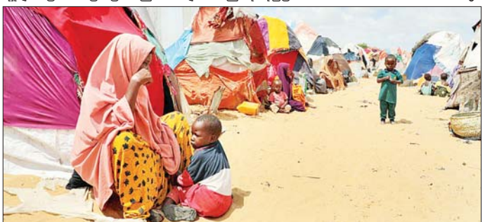
ဆိုမာလီယာနိုင်ငံရှိ ဒုက္ခသည်စခန်းတွင် ရောက်ရှိနေကြသူများကို တွေ့ရစဉ်။

မိုးသည်းထန်စွာ ရွာသွန်းမှုနှင့် ရေကြီးရေလျှံမှုများသည် ၂၀၂၃ ခုနှစ် နှစ်ကုန်ပိုင်းတွင် လျော့ကျ သွားသော်လည်း ဆိုမာလီယာ တွင် ရာသီဥတုအကျပ်အတည်း မှာ ဆက်လက်ရှိနေဆဲဖြစ်သည်။ ရေကြီးမှုနှင့် မိုးခေါင်မှုများကြောင့် ဆိုမာလီယာအများအပြားကို နေရပ် စွန့်ခွာရန် ဖိအားဖြစ်ပေါ်ခဲ့ သည်ဟု ကုလအေဂျင်စီက ပြောသည်။ ခင်ဗွား