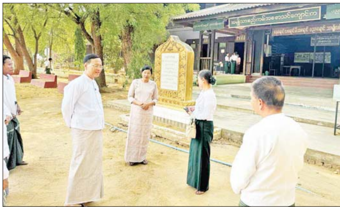
ဝန်ကြီးဌာနနှင့်ပူးပေါင်း၍ အားကစားနည်းပြဆရာ လျက်ရှိသော စီမံခန့်ခွဲရေးနှင့် စာသင်ဆောင်ကို ရက်တိုသင်တန်းတက်ရောက်ရန် မှာကြားကာ ကြည့်ရှုစစ်ဆေးခဲ့ကြောင်း သိရသည်။ မိတ္ထီလာပညာရေးဒီဂရီကောလိပ်အတွင်း တည်ဆောက်သတင်းစဉ်

ထို့နောက် မိတ္ထီလာပညာရေးဒီဂရီကောလိပ်သို့ ရောက်ရှိပြီး ဒုတိယဝန်ကြီးက ၂၀၂၃-၂၀၂၄ ဘဏ္ဍာငွေဖြင့် ဝယ်ယူထားသော ပြေးခုန်ပစ်အားကစားပစ္စည်းအမျိုးမျိုးကို အကျိုးရှိ ထိရောက်စွာအသုံးပြု၍ ကျောင်းသား ကျောင်းသူများကို အားကစားလေ့ကျင့်ပျိုးထောင်ပေးကာ ဒီဇင်ဘာအားကစားပွဲတော်အတွက် ပြင်ဆင်ပေးရန် အားကစားနှင့်လူငယ်ရေးရာ