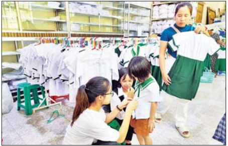
ကျောင်းဝတ်စုံ အရောင်းဆိုင်တစ်ဆိုင်ကို တွေ့ရစဉ်။

ရန်ကုန် ဧပြီ ၂၈ ရန်ကုန်ဈေးကွက်အတွင်း ကျောင်းအသုံးအဆောင်ပစ္စည်းများ ယခုလပိုင်းအတွင်း တိုးမြှင့်ရောင်းချနေသည့်အပြင် နယ်အများများ ရရှိမှု များပြားနေကြောင်း ကျောင်းအသုံးအဆောင် ပစ္စည်းများ ရောင်းချနေသူများထံမှ သိရသည်။