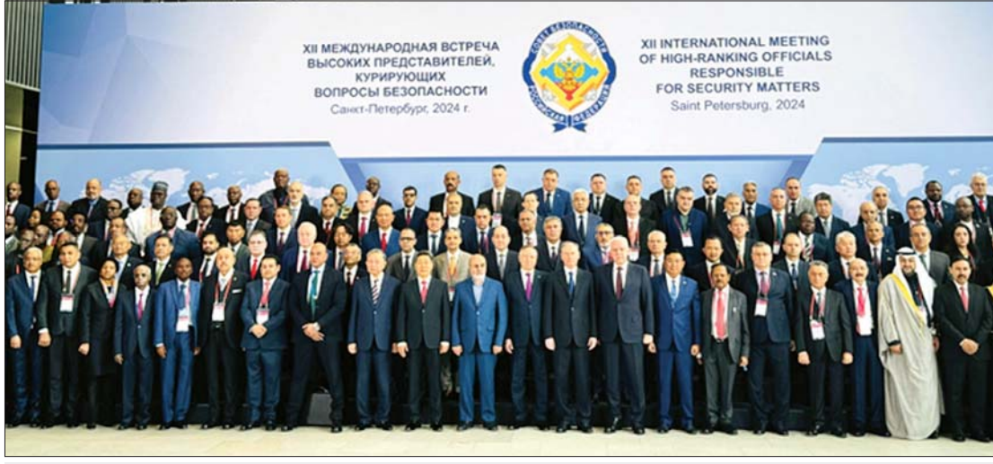
(၁၂) ကြိမ်မြောက် လုံခြုံရေးကိစ္စရပ်များဆိုင်ရာ အဆင့်မြင့်အရာရှိကြီးများ မျက်နှာစုံညီအစည်းအဝေးသို့ တက်ရောက်လာကြသူများ မှတ်တမ်းတင်ဓာတ်ပုံရိုက်စဉ်။