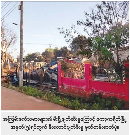
အကြမ်းဖက်သမားများ၏ မီးရှို့ဖျက်ဆီးမှုကြောင့် ကော့ကရိတ်မြို့ အမှတ်(၅)ရပ်ကွက် မီးလောင်ပျက်စီးမှု မှတ်တမ်းဓာတ်ပုံ။

စာမျက်နှာ ၂၀ မှ အကြမ်းဖက် သောင်းကျန်းသူများ ၏ နေရာဖျက်တိုက်ခိုက်မှုများ ကြောင့် စိုးရိမ်ထိတ်လန့်ပြီး ယာယီ နေရပ်စွန့်ခွာခဲ့ကြသည့် ဒေသခံ ပြည်သူများ ပြန်လည်ဝင်ရောက် နေထိုင်ရေး စည်းရုံးဆောင်ရွက်ခဲ့ ရာ ဧပြီ ၂၇ ရက်အထိ ကော့ကရိတ် မြို့တွင်းသို့ အိမ်ထောင်စု ၂၈၈ စု၊ အမျိုးသား ၃၆၂ ဦး၊ အမျိုးသမီး ၂၄၇ ဦး စုစုပေါင်း ၅၀၉ ဦး ပြန်လည်ဝင်ရောက် နေထိုင်လာ ကြကြောင်း သိရှိရပြီး ဆက်လက် ရွှိလည်း ၎င်းတို့၏နေရပ်အသီးသီး သို့ ပြန်လည်ဝင်ရောက်နေထိုင် လျက်ရှိကြောင်း သတင်းရရှိသည်။ သတင်းစဉ်