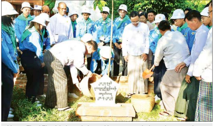
တိုင်းဒေသကြီး ဝန်ကြီးချုပ် ဦးမျိုးအောင်နှင့် တာဝန်ရှိသူများက လူရည်ချွန် ကျောင်းသား ကျောင်းသူများ နှင့်အတူ အမှတ်တရ သစ်ပင်စိုက်ပျိုးစဉ်။