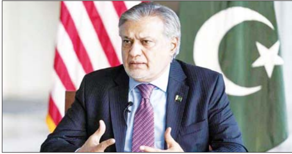
Nawaz (PML-N) ပါတီ၏ အရေးပါသူ တစ်ဦး ဝန်ကြီးအဖြစ်လည်း အကြိမ်ပေါင်းများစွာ လည်းဖြစ်ကြောင်း သိရသည်။ ၎င်းသည် တာဝန်ထမ်းဆောင်ခဲ့ကြောင်း သိရသည်။ ခင်ဗွား

အစ္စလာမာဘတ် ဧပြီ ၂၈ ပါကစ္စတန်နိုင်ငံခြားရေးဝန်ကြီး အက်စ်ဟက်ဒါကို ဒုတိယဝန်ကြီးချုပ်အဖြစ် တာဝန်ခန့်အပ်ကြောင်း ဧပြီ ၂၈ ရက်တွင် ပါကစ္စတန်အစိုးရအဖွဲ့ရုံး၏ အကြောင်းကြားစာတွင် ဖော်ပြထားသည်။