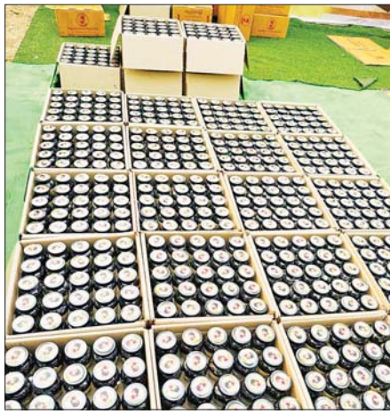
ဈေးကွက်သို့တင်ပို့ရောင်းချရန် ပါကင်ထုပ်ပြီးသော ချက်ဆေးဘူးများ။

ကုန်ကြမ်းရရှိဖို့ သီးသန့်စိုက်ခင်းတွေရှိတယ်။ လိုအပ်လို့ ကုန်ကြမ်းမှာယူ ဝယ်ယူရတာလည်း ရှိပါတယ်။ ပါဝင်တဲ့ပစ္စည်းတွေကတော့ ရှားစောင်းလက်ပပ်၊ ထန်းဖိုးထန်းလျက်၊ နှမ်းနက်ဆီ၊ ကြက်သွန်ဖြူ၊ တစ်လုံးဥ၊ ဆားပုပ်ခဲ၊ စမုန်နက်၊ အုန်းသီး၊ စမုန်မျိုးငါးပါးနဲ့ မန်ကျည်သီးတို့ ပါဝင်ပါတယ်။