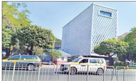
ရန်ကုန်မြို့တွင်းလမ်းမများပေါ်၌ ပြေးဆွဲနေသော တက္ကစီအချို့။

သဖြင့် ဆီဖိုးပြန်လည်တွက်ချက်ပြီးပါက တွက်ခြေမကိုက်သည့် ရက်ပင်ရှိကြောင်း ၎င်းကပြောကြားသည်။ “ပြီးခဲ့သည့် နှစ်ရက်ကဆိုရင် တစ်ရက်လုံးဆွဲတာ ငွေကျပ် ၁၅၀၀၀၊ ၂၀၀၀၀ လောက်ပဲရတယ်။ နေ့လယ်ပိုင်းတွေမှာ သိပ်မဆွဲရဘူး။ ဆီဖိုးနဲ့ သိပ်မကျန်ဘူး” ဟု အခြားတက္ကစီယာဉ်မောင်းတစ်ဦးက ဆိုသည်။ နေ့အပူချိန် မြင့်တက်မှုများကြောင့် ယာဉ်မောင်းများအနေဖြင့် ကျန်းမာရေးအတွက် ဂရုစိုက်ပြီး သတိထား မောင်းနေရသကဲ့သို့ ကားအင်ဂျင်အပူလွန်ကာပြီး ကားမီးလောင်မှုအန္တရာယ်ကို လည်း သတိပြုနေကြောင်း သိရသည်။