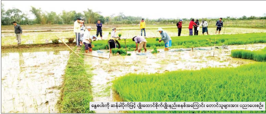
နွေစပါးကို ဆန်ခါပိုက်ဖြင့် ပျိုးထောင်စိုက်ပျိုးနည်းစနစ်အကြောင်း တောင်းသူများအား ပညာပေးစဉ်။

အမှန်တကယ် ဂျီ အီး ဟာဗေး ပြောချင်သည့် အဓိပ္ပာယ်မှာ မြန်မာနိုင်ငံသည် ရေခဲမြေခဲကောင်းပြီး မြေဆီမြေဩဇာနှင့် ပြည့်စုံသော စိုက်ပျိုးမြေများရှိ