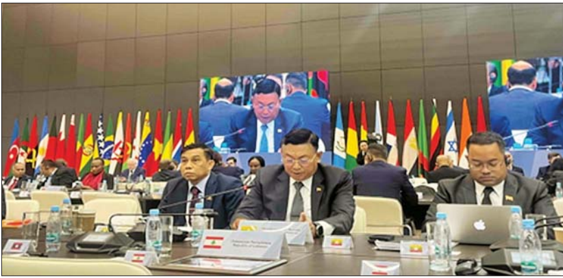
အမျိုးသားလုံခြုံရေးဆိုင်ရာ အကြံပေးပုဂ္ဂိုလ်နိုင်ငံတော်စီမံအုပ်ချုပ်ရေးကောင်စီဥက္ကဋ္ဌရှုံး ဝန်ကြီးဌာန (၄) ပြည်ထောင်စုဝန်ကြီး ဗိုလ်ချုပ်ကြီး မိုးအောင် (၁၂) ကြိမ်မြောက် လုံခြုံရေးကိစ္စရပ်များဆိုင်ရာ အဆင့်မြင့်အရာရှိကြီးများ မျက်နှာစုံညီအစည်းအဝေး ဒုတိယနေ့တွင် ပါဝင်ဆွေးနွေးစဉ်။

နေပြည်တော် ဧပြီ ၂၈ အမျိုးသားလုံခြုံရေးဆိုင်ရာ အကြံပေးပုဂ္ဂိုလ်နိုင်ငံတော်စီမံအုပ်ချုပ်ရေးကောင်စီ ဥက္ကဋ္ဌရှုံး ဝန်ကြီးဌာန (၄) ပြည်ထောင်စုဝန်ကြီး ဗိုလ်ချုပ်ကြီး မိုးအောင် ဦးဆောင်သော မြန်မာကိုယ်စားလှယ်အဖွဲ့သည် ရုရှားဖက်ဒရေးရှင်းနိုင်ငံ စီနိုပီတာစဘတ်မြို့၌ ဧပြီ ၂၃ ရက်မှ ၂၅ ရက်အထိ ကျင်းပသည့် (၁၂) ကြိမ်မြောက် လုံခြုံရေးကိစ္စရပ်များဆိုင်ရာ အဆင့်မြင့်အရာရှိကြီးများအစည်းအဝေးသို့ တက်ရောက်ခဲ့ပြီး ဧပြီ ၂၆ ရက် ဒေသစံတော်ချိန် ည ၁၀ နာရီတွင် ရုရှားဖက်ဒရေးရှင်းနိုင်ငံ စီနိုပီတာစဘတ်မြို့လေဆိပ်မှ လေကြောင်းခရီးဖြင့် ထွက်ခွာလာခဲ့ပြီး ဧပြီ ၂၇ ရက် ည ၉ နာရီ မိနစ် ၄၀ တွင် ရန်ကုန်သို့ ပြန်လည်ရောက်ရှိခဲ့ရာ ရန်ကုန်အပြည်ပြည်ဆိုင်ရာလေဆိပ်တွင် တာဝန်ရှိသူများက ကြိုဆိုနှုတ်ဆက်ခဲ့ကြသည်။