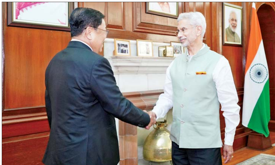
ဒုတိယဝန်ကြီးချုပ်နှင့် ပြည်ထောင်စုဝန်ကြီး ဦးသန်းဆွေ အိန္ဒိယပြည်ပရေးရာဝန်ကြီး ဒေါက်တာအက်စ်ဂျိုင်ရှန်ကာအား ရင်းရင်းနှီးနှီးနှုတ်ဆက်စဉ်။