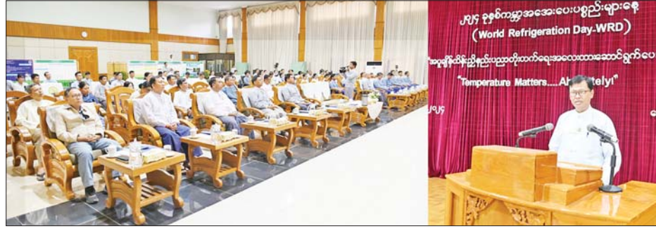
ဆက်လက်ရပ်တည်နိုင်ရေး ဖန်တီးပေးရန် အထူးပင်လိုအပ်ကြောင်းနှင့် အနာဂတ်တွင် အပူချိန်ထိန်းညှိနည်းပညာတိုးတက်စေရန်၊ တိုးတက်လာသည့်နည်းပညာများကို အစဉ်လေ့လာပြီး အိုင်စီအဖွဲ့နှင့် ရာသီဥတုစနစ် မထိခိုက်စေရေး စနစ်တကျအသုံးချနိုင်ရန်အတွက် မိမိတို့ဌာနဆိုင်ရာများသာမက လုပ်ငန်းရှင်များနှင့် ပြည်သူ့လူထုမှ အားလုံးပူးပေါင်းပါဝင်ဆောင်ရွက်ကြရန် လိုအပ်ကြောင်း တိုက်တွန်းပြောကြားသည်။ ထို့နောက် ၂၀၂၄ ခုနှစ် ကမ္ဘာ့အအေးပေးပစ္စည်းများနေ့အထိမ်းအမှတ် အသိပညာပေးဗီဒီယိုကို ကြည့်ရှုအားပေးပြီး ခင်းကျင်းပြသထားသည့် ပြခန်းများကို လှည့်လည်ကြည့်ရှုခဲ့ကြကြောင်း သိရသည်။ သတင်းစဉ်

ကြောင်း၊ ခေတ်မီအပူချိန်ထိန်းညှိနည်းပညာသည် စွမ်းအင်ချွေတာခြင်းနှင့် ထိရောက်စွာ အသုံးပြုခြင်းသာမက မှန်လုံအိမ်ဓာတ်ငွေ့ထုတ်လွှတ်မှု လျော့နည်းစေသည့်အတွက် အပူပေး သို့မဟုတ် အအေးပေးပစ္စည်းများထုတ်လုပ်သည့် စက်ရုံများအနေဖြင့် ၎င်းနည်းပညာကို အသုံးပြုခြင်းသည် ရာသီဥတုပြောင်းလဲမှုကို ရင်ဆိုင်ဖြေရှင်းရာတွင် အဓိကအခန်းကဏ္ဍပါဝင်လျက်ရှိကြောင်း၊ ထို့ကြောင့် အအေးပေးနည်းပညာနှင့် သက်ဆိုင်သောလုပ်ငန်းများတွင် တိုးတက်လာသည့် ခေတ်ရေစီးကြောင်းနှင့်အညီ အမိလိုက်ပြီး တွေးခေါ်နိုင်သည့် ပညာရှင်များအား အလုပ်ခန့်ထားရန်၊ ကျောင်း၊ ကောလိပ်၊ တက္ကသိုလ်များတွင်လည်း နည်းပညာရပ်အသစ်များ သင်ကြားပေးရန်နှင့် အအေးပေးနည်းပညာလုပ်ငန်းများ