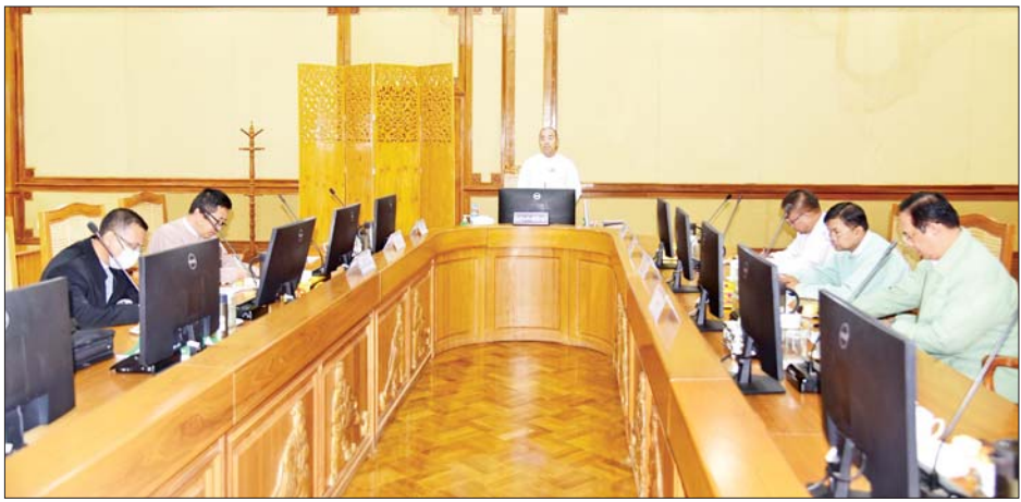
၅၉၂ သန်းအပါအဝင် ကျပ် ၄၆၂၀၆ ဒသမ ၃၀၁ သန်း အနေဖြင့် ပြည်တွင်း ၁၄၈၄ ဦးနှင့် ပြည်ပ ၆၈ ကို ခွင့်ပြုပေးထားခဲ့ပြီး အဆိုပါလုပ်ငန်းများမှ ဦးကို ဖန်တီးပေးနိုင်ခဲ့ကြောင်း သိရသည်။ ရှမ်းပြည်နယ်အတွင်း အလုပ်အကိုင်အခွင့်အလမ်း ပြည်နယ်(ပြန်/ဆက်)

ကော်မတီအတွင်းရေးမှူး ပြည်နယ်ရင်းနှီးမြှုပ်နှံမှုနှင့် ကုမ္ပဏီများညွှန်ကြားမှုဦးစီးဌာန ညွှန်ကြားရေးမှူး ဦးလေးနိုင်က Myanmar LT Development Co., Ltd. ၏ တည်ဆောက်ရေးကာလ တိုးမြှင့်ခွင့် ပြုရန် တင်ပြလာခြင်းအပေါ် ရှင်းလင်းတင်ပြပြီး တက်ရောက်လာသည့် ကော်မတီအဖွဲ့ဝင်များက အထွေထွေကိစ္စရပ်များကို ဆွေးနွေးကြ၍ ရှမ်းပြည်နယ် ရင်းနှီးမြှုပ်နှံမှုကော်မတီဥက္ကဋ္ဌ ပြည်နယ်ဝန်ကြီးချုပ်က နိဂုံးချုပ်အမှာစကား ပြောကြားသည်။ ရှမ်းပြည်နယ်ရင်းနှီးမြှုပ်နှံမှု ကော်မတီအနေဖြင့် နိုင်ငံခြားရင်းနှီးမြှုပ်နှံမှုလုပ်ငန်း ခုနစ်ခု၊ ရင်းနှီးမြှုပ်နှံမှုမာဏ အမေရိကန်ဒေါ်လာ ၁၆ ဒသမ ၁၆၃ သန်းနှင့် မြန်မာနိုင်ငံသားရင်းနှီးမြှုပ်နှံမှုလုပ်ငန်း ၁၈ ခု ရင်းနှီးမြှုပ်နှံမှုမာဏ အမေရိကန်ဒေါ်လာ ၇ ဒသမ