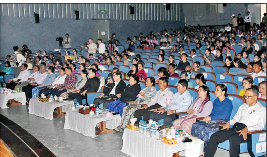
ပြည်ထောင်စုဝန်ကြီး ဦးမောင်မောင်အုန်းနှင့် တက်ရောက်လာကြသူများ မြန်မာနိုင်ငံ ဂီတနေ့အထိမ်းအမှတ် တေးဂီတဖျော်ဖြေပွဲတွင် သီဆိုဖျော်ဖြေမှုအား ကြည့်ရှုအားပေးစဉ်။

တန်ဖိုးရှိ အလှလက်ကိုင်မီး ၁၀၀၀ အား မေတ္တာလက်ဆောင် ပေးအပ်ရာ အဆိုပါ အလှလက်ကိုင်မီးများဖြင့် ပရိသတ်များက တစ်ခဲနက် ကြည့်ရှုအားပေး၍ လိုက်ပါသီဆိုကြသည်။