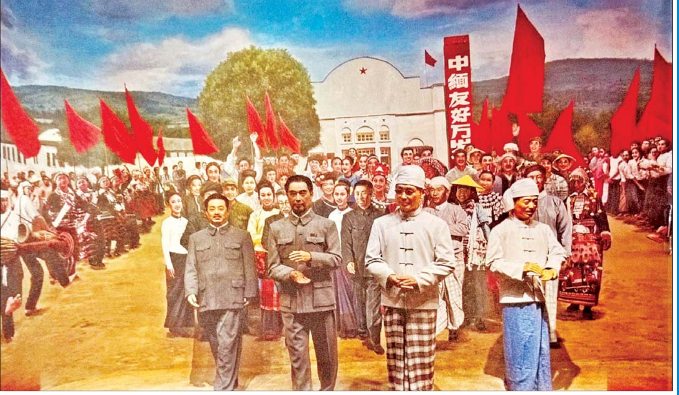
မန်စီမြို့ပြတိုက်တွင် ပြသထားသည့် နှစ်နိုင်ငံဝန်ကြီးချုပ်များ ရုပ်လုံးကြွရုပ်တုနှင့် ပန်းချီကားကို တွေ့ရစဉ်။

တရုတ်-မြန်မာ ထာဝရအိမ်နီးနားချင်းကောင်းဆက်ဆံရေးသမိုင်းကို ဖော်ညွှန်းသည့်- မိတ်ဆွေဇမ္ဗူ၊ စဉ်စုစိုက်ပျိုးမှု တရုတ်မြန်မာ၊ မင်းတို့မှာလျှင် ကမ္ဘာရှည်မြေ၊ မြေမရွေ့သို့ နှုတ်တွေ့ခွန်းသေ၊ ထွန်းစိမ့်စေဖြင့် ကျက်သရေသွင်းနှိုး၊ စာရင်းထိုးသည် ဆိုမျိုးဆက်စဉ် ဥဒါန်းတည်း။ ဟူသည့် “မော်ကွန်း”ကို ကုန်းဘောင်ခေတ်ဝက်မစွတ် မြို့စားဦးနု (ဒုတိယနဝဒေး) ၏ “တရုတ်သံရောက် မော်ကွန်း” တွင် ရေးဖွဲ့ထားသည်ကို တွေ့ရပါသည်။ မြန်မာတို့ကသာ စပ်ဆိုရေးသားခဲ့သည် မဟုတ်ပါ။ တရုတ်စာပေများတွင်လည်း စပ်ဆိုခဲ့ကြောင်းကို ၁၉၆၁ ခုနှစ် ဇန်နဝါရီလ ၆ ရက်နေ့ နံနက်ပိုင်းက ရန်ကုန်မြို့ အောင်ဆန်းကွင်းတွင် ကျင်းပသည့် လူထုအစည်းအဝေးပွဲကြီးတွင် တရုတ်နိုင်ငံ ဝန်ကြီးချုပ် “ချူအင်လိုင်” က “ကျွန်တော်တို့နိုင်ငံ “ဟန်” မင်းဆက်ခေတ်ကဗျာဆရာများဟာ ထိုအခါက တရုတ်ပြည်မှာ တင်ဆက်ပြခဲ့ကြတဲ့ မြန်မာ တေးဂီတနှင့်အကတို့ကို ကဗျာများ အထူးဖွဲ့နွဲ့ သီကုံးပြီး ချီးကျူးခဲ့ဖူးပါတယ်”ဟု ပြောကြားခဲ့ခြင်းက သက်သေခံနေပါသည်။ ထိုအတူ လွတ်လပ်ရေးရပြီးခေတ်တွင်လည်း တရုတ်-မြန်မာ ချစ်ကြည်ရေးသီချင်းများ စပ်ဆိုထုတ်လွှင့်ခဲ့ပါသည်။ ရာဇဝင်စဉ်လာ၊ တရုတ် ဗမာ-မိတ်ဆွေရင်းချာ အထက်ပါစာသားသည် တရုတ်-မြန်မာ (ထိုစဉ်ကအသုံးအနှုန်း “ဗမာ”) ချစ်ကြည်ရေးပွဲများ၊ အစည်းအဝေးပွဲများတွင် သီဆိုခဲ့ပြီး ပီကင်းရေဒီယို အသံမှ ရုပ်နှံရုံခါ ထုတ်လွှင့်ခဲ့သည့်သီချင်းမှ စာသား တစ်ပိုဒ်ဖြစ်ပါသည်။ ဆရာကြီး “ဦးသိန်းဖေမြင့်”