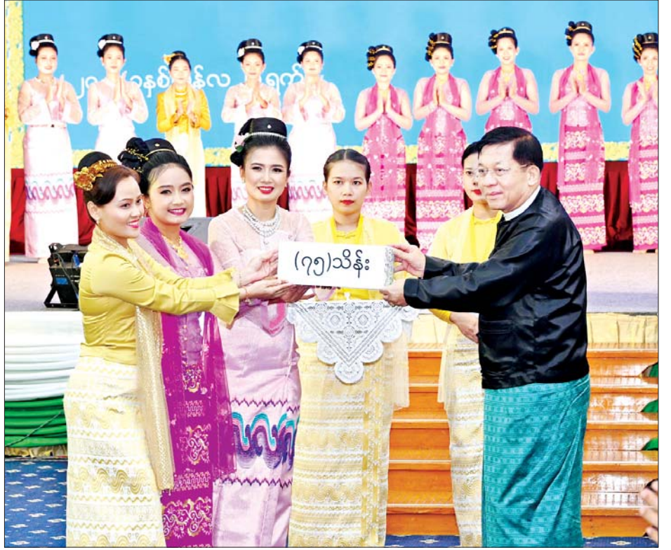
နိုင်ငံတော်စီမံအုပ်ချုပ်ရေးကောင်စီဥက္ကဋ္ဌ နိုင်ငံတော်ဝန်ကြီးချုပ် ဗိုလ်ချုပ်မှူးကြီးမင်းအောင်လှိုင် သီဆိုကပြပျော်ဖြေတင်ဆက်ခဲ့ကြသည့် အနုပညာရှင်များအား ဂုဏ်ပြုပန်းခြင်းနှင့် ဂုဏ်ပြုဆုငွေများ ပေးအပ်ချီးမြှင့်စဉ်။

ဇွန် ၂၇ ရက်နေ့မှာ အခမ်းအနားသို့ နိုင်ငံတော် စီမံအုပ်ချုပ်ရေးကောင်စီ ဥက္ကဋ္ဌ နိုင်ငံတော်ဝန်ကြီးချုပ် ဗိုလ်ချုပ်မှူးကြီး မင်းအောင်လှိုင်၊ ကောင်စီ ဒုတိယဥက္ကဋ္ဌ ဒုတိယဝန်ကြီးချုပ် ဒုတိယဗိုလ်ချုပ်မှူးကြီး စိုးဝင်း၊ ကောင်စီတွဲဖက်အတွင်းရေးမှူး ဒုတိယဗိုလ်ချုပ်ကြီး ရဲဝင်းဦး၊ ကောင်စီဝင်များ၊ ပြည်ထောင်စုဝန်ကြီးများနှင့်ပြည်ထောင်စုအဆင့်