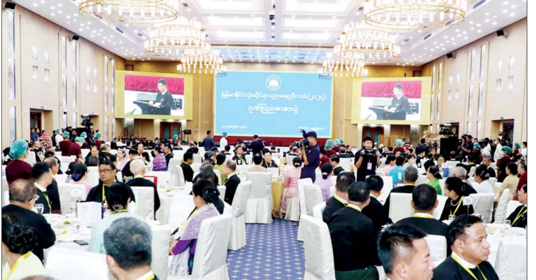
မြန်မာနိုင်ငံလုံးဆိုင်ရာပညာရေးညီလာခံ(၂၀၂၄) ဂုဏ်ပြုညစာစားပွဲအခမ်းအနားတွင် အနုပညာရှင်များက သီဆိုကပြပျော်ဖြေတင်ဆက်ကြစဉ်။