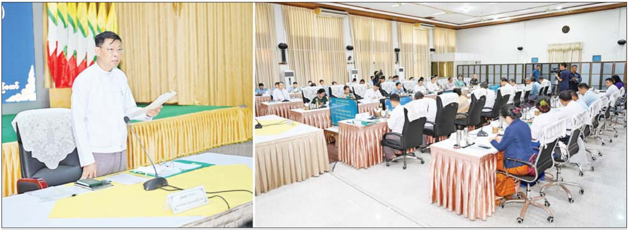
ဒီဂျစ်တယ်စီးပွားရေးဖွံ့ဖြိုးတိုးတက်မှုကော်မတီနာယက နိုင်ငံတော်စီမံအုပ်ချုပ်ရေးကောင်စီအဖွဲ့ဝင် ဒုတိယဝန်ကြီးချုပ်နှင့် ပြည်ထောင်စု ဝန်ကြီး ဗိုလ်ချုပ်ကြီး မြထွန်းဦး ဒီဂျစ်တယ်စီးပွားရေးဖွံ့ဖြိုးတိုးတက်မှုကော်မတီ၏ ဒုတိယအကြိမ် လုပ်ငန်းညှိနှိုင်းအစည်းအဝေး(၁/၂၀၂၄) တွင် အမှာစကားပြောကြားစဉ်။

နေပြည်တော် ဇွန် ၂၇ ဒီဂျစ်တယ် စီးပွားရေးဖွံ့ဖြိုး တိုးတက်မှုကော်မတီ၏ ဒုတိယ အကြိမ် လုပ်ငန်းညှိနှိုင်းအစည်း အဝေး(၁/၂၀၂၄)ကို ယနေ့နံနက် ပိုင်းတွင် စီးပွားရေးနှင့်ကူးသန်း ရောင်းဝယ်ရေး ဝန်ကြီးဌာန ရုံးအမှတ်(၃) ညီလာခံခန်းမ၌ ကျင်းပရာ ဒီဂျစ်တယ်စီးပွားရေး ဖွံ့ဖြိုးတိုးတက်မှုကော်မတီနာယက နိုင်ငံတော်စီမံအုပ်ချုပ်ရေးကောင်စီ အဖွဲ့ဝင် ဒုတိယဝန်ကြီးချုပ်နှင့် ပို့ဆောင်ရေးနှင့် ဆက်သွယ်ရေး ဝန်ကြီးဌာန ပြည်ထောင်စုဝန်ကြီး ဗိုလ်ချုပ်ကြီးမြထွန်းဦး တက်ရောက် အမှာစကားပြောကြားသည်။