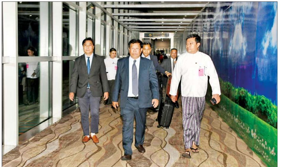
ဒုတိယဝန်ကြီးချုပ်နှင့် ပြည်ထောင်စုဝန်ကြီး ဦးသန်းဆွေ ရန်ကုန်အပြည်ပြည်ဆိုင်ရာလေဆိပ်သို့ ပြန်လည်ရောက်ရှိစဉ်။

နယူးဒေလီ ဇွန် ၂၇ အာရှပူးပေါင်းဆောင်ရွက်ရေးဆိုင်ရာ ဆွေးနွေးပွဲအဖွဲ့ (အေစီဒီ)၏ (၁၉)ကြိမ်မြောက် နိုင်ငံခြားရေးဝန်ကြီးများ အစည်းအဝေးသို့ ပါဝင်တက်ရောက်ခဲ့သည့် ဒုတိယဝန်ကြီးချုပ်နှင့် နိုင်ငံခြားရေးဝန်ကြီးဌာန ပြည်ထောင်စုဝန်ကြီး ဦးသန်းဆွေသည် ခရီးစဉ်ဒုတိယပိုင်းအဖြစ် ဇွန် ၂၅ ရက်က အီရန်နိုင်ငံ တီဟီရန်မြို့မှ အိန္ဒိယနိုင်ငံ နယူးဒေလီမြို့သို့ ဆက်လက်ထွက်ခွာလာရာ ဇွန် ၂၆ ရက် နံနက်ပိုင်းတွင် နယူးဒေလီမြို့သို့ ရောက်ရှိသည်။