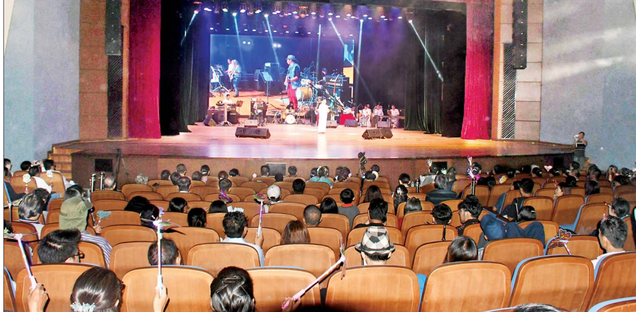
မြန်မာနိုင်ငံဂီတနေ့ အထိမ်းအမှတ် တေးဂီတဖျော်ဖြေပွဲ ကျင်းပစဉ်။

ယနေ့ ဇွန် ၂၇ ရက်တွင် ကျရောက်သည့် မြန်မာနိုင်ငံ ဂီတနေ့ ဂီတဖျော်ဖြေပွဲသို့ ဂီတအလွှာအသီးသီးမှ အနုပညာရှင်များ၊ တေးသီချင်းချစ်သူပရိသတ်များ စုံညီစွာ တက်ရောက်ကြပြီး ပျော်ရွှင်စွာ ပါဝင်ဆင်နွှဲလျက်ရှိကြသည်။ သတင်းစဉ်