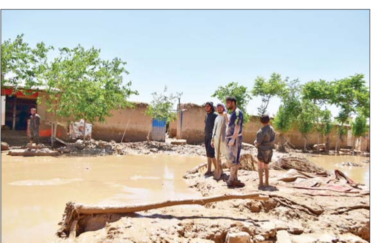
အပြားဆုံးရှုံးခဲ့ပြီး စိုက်ပျိုးမြေဧကများစွာ ပျက်စီးခဲ့ကြောင်း တာဝန်ရှိသူများက ပြောသည်။ အလားတူ ဇွန် ၂၅ ရက်တွင် ဘတ်ဒက်ရှန် ပြည်နယ်မြောက်ပိုင်း ကိုးကား - ဆင်ဟွာ၊ ဘာသာပြန် - အောင်ကျော်ကျော်

ကဘူး ဇွန် ၂၇ အာဖဂန်နစ္စတန်နိုင်ငံ အလယ်ပိုင်း ဘာမီယန်ပြည်နယ်တွင် ဇွန် ၂၆ ရက်က မိုးသည်းထန်စွာရွာသွန်းပြီး ရေကြီးရေလျှံ မှုများကြောင့် ခုနစ်ဦးသေဆုံးကာ ၁၀ ဦး ပျောက်ဆုံးနေကြောင်း ပြည်နယ်အစိုးရ ပြောရေးဆိုခွင့်ရှိသူ ဆင်းဟာနီက ပြောကြားသည်။ ယာကော်လန်ခရိုင်ရှိ နေရာအများ အပြား၌ ရေကြီးရေလျှံမှုများဖြစ်ပွားရာ ကယ်ဆယ်ရေးလုပ်သားများက သေဆုံး သူများ၏ ရုပ်အလောင်းများကို ရှာဖွေ လျက်ရှိပြီး အသက်ရှင်ကျန်ရစ်သူများ ကို ပြန်လည်ဆယ်ယူရန် ကြိုးပမ်း လုပ်ဆောင်နေကြောင်း ပြည်နယ်အစိုးရ ပြောရေးဆိုခွင့်ရှိသူ ဆင်းဟာနီက ပြောကြားသည်။ ရေကြီးမှုကြောင့် အိမ်ခြေအများ