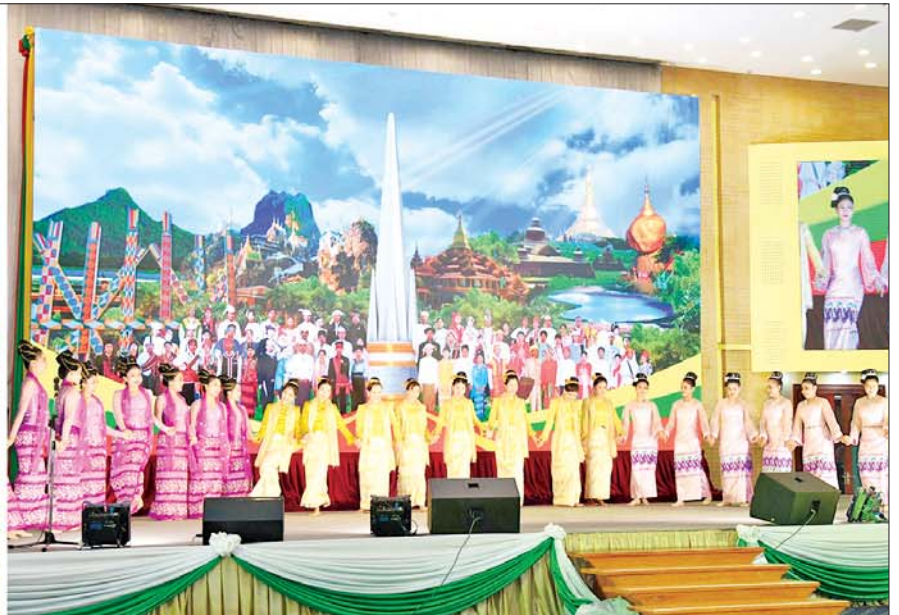
နိုင်ငံတော်စီမံအုပ်ချုပ်ရေးကောင်စီဥက္ကဋ္ဌ နိုင်ငံတော်ဝန်ကြီးချုပ် ဗိုလ်ချုပ်မှူးကြီးမင်းအောင်လှိုင်နှင့် အခမ်းအနားတက်ရောက်လာကြသူများ အနုပညာရှင်များ၏ သီဆိုကပြဖျော်ဖြေတင်ဆက်မှုကို ကြည့်ရှုအားပေးစဉ်။