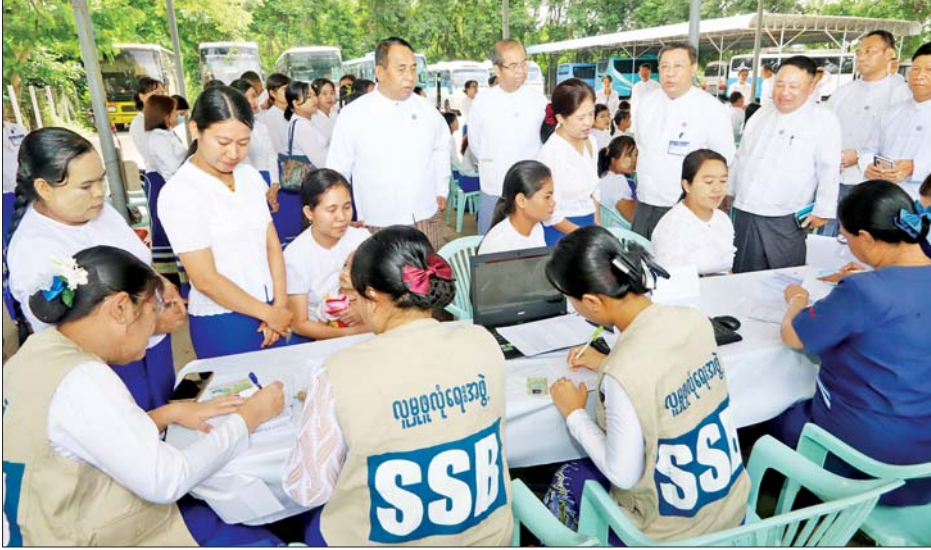
မေလတွင် အကျုံးဝင်အာမခံအလုပ်သမား ၁၂၃၄၉၈ ဦးရှိပြီး ကျန်းမာရေးစောင့်ရှောက်မှုအတွက် လူမှုဖူလုံရေးအဖွဲ့ပိုင်ဆေးရုံကြီး သုံးရုံ၊ မြို့နယ်လူမှုဖူလုံရေးဆေးခန်း ၉၆ ခန်း၊ ဌာနကြီးဆေးခန်း ၆၁ ခန်း၊ စာချုပ်

နေပြည်တော် ဇွန် ၂၇ အလုပ်သမားဝန်ကြီးဌာန ပြည်ထောင်စုဝန်ကြီးဦးမြင့်နောင်သည် ယနေ့နံနက်ပိုင်းတွင် လူမှုဖူလုံရေးအဖွဲ့ ရွေ့လျားဆေးကုသယာဉ်ဖြင့် နေပြည်တော်ကောင်စီရှိ လူမှုဖူလုံရေးအကျုံးဝင် အာမခံအလုပ်သမားများအား ဆေးဝါးကုသပေးမှု၊ ဓာတ်ခွဲစစ်ဆေးပေးမှုနှင့် နှလုံးအတွက် ECG စစ်ဆေးခြင်းများ ကွင်းဆင်းဆောင်ရွက်ပေးနေမှုကို ကြည့်ရှုအားပေးသည်။ လူမှုဖူလုံရေးအဖွဲ့က ရွေ့လျားဆေးကုသယာဉ်ဖြင့် ယနေ့တွင် အလုပ်သမားဝန်ကြီးဌာနရှိ ဝန်ထမ်းများကို ကျန်းမာရေးစောင့်ရှောက်မှုများ ဆောင်ရွက်ပေးရာ ဆေးဝါးကုသမှု စုစုပေါင်း ၂၃၇ ဦးအနက် ဓာတ်ခွဲစစ်ဆေးမှု ၁၀၆ ဦး၊ နှလုံးအတွက် ECG စစ်ဆေးခြင်း ၂၈ ဦးတို့ကို ဆောင်ရွက်ပေးသည်။ လူမှုဖူလုံရေးအဖွဲ့က လူမှုဖူလုံရေးစီမံကိန်းကို အကောင်အထည်ဖော်ဆောင်ရွက်ရာ၌ ၂၀၂၄ ခုနှစ်