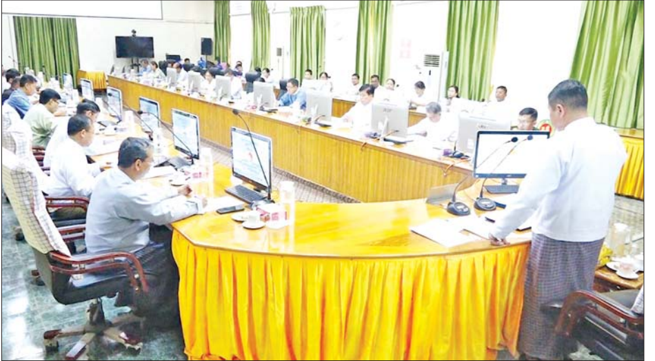
ရှင်းလင်းတင်ပြသည်။ ထို့နောက် လုပ်ငန်းဆပ်ကော်မတီဝင်များက သက်ဆိုင်ရာ ကဏ္ဍအလိုက် ဆွေးနွေးတင်ပြကြပြီး တက်ရောက်လာသူများ၏ ဖြည့်စွက်အကြံပြုဆွေးနွေးချက်များအပေါ် ပြည်နယ်ဝန်ကြီးချုပ်က လိုအပ်သည်များကို ပေါင်းစပ်ညှိနှိုင်းဆောင်ရွက်ပေးခဲ့ကာ နိဂုံးချုပ်အမှာစကားပြောကြားခဲ့ကြောင်း သိရသည်။ ခရိုင်(ပြန်/ဆက်)

ပြည်နယ်ဖွံ့ဖြိုးရေးလုပ်ငန်းများနှင့် နယ်စပ်ဒေသဖွံ့ဖြိုးရေးလုပ်ငန်းစဉ်များ အောင်မြင်အောင် ပိုင်းဝန်းကြိုးပမ်းဆောင်ရွက်သွားကြရန် တိုက်တွန်းလိုပါကြောင်း အမှာစကားပြောကြားသည်။ ဆက်လက်ပြီး မွန်ပြည်နယ်ဒေသဆိုင်ရာလုပ်ငန်းကော်မတီ အတွင်းရေးမှူး၊ ပြည်နယ်လုံခြုံရေးနှင့် နယ်စပ်ရေးရာဝန်ကြီးက နယ်စပ်ဒေသနှင့် တိုင်းရင်းသားလူမျိုးများဖွံ့ဖြိုးတိုးတက်မှု အကောင်အထည်ဖော်ရေး ဆောင်ရွက်ထားရှိမှု အခြေအနေကို လည်းကောင်း၊ လုပ်ငန်းကော်မတီ တွဲဖက်အတွင်းရေးမှူး၊ နယ်စပ်ဒေသနှင့် တိုင်းရင်းသားလူမျိုးများဖွံ့ဖြိုးတိုးတက်ရေးဦးစီးဌာန ညွှန်ကြားရေးမှူးက မွန်ပြည်နယ်ဒေသဆိုင်ရာလုပ်ငန်းကော်မတီ၏ လုပ်ငန်းဆောင်ရွက်ထားရှိမှု အခြေအနေတို့ကို လည်းကောင်း