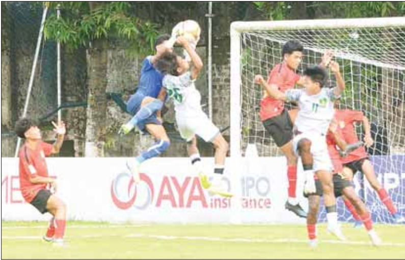
ဧရာဝတီယူနိုက်တက်အသင်းနှင့် မြဝတီအသင်းတို့ ယှဉ်ပြိုင်ကစားစဉ်။

ရန်ကုန် ဇွန် ၁၃ ၂၀၂၄ ရာသီ MNL ယူ-၂၀ လိဂ်ပြိုင်ပွဲ ပွဲစဉ် (၃) ပထမနေ့ကို ဇွန် ၁၃ ရက်က ဆက်လက်ကျင်းပရာ ရှမ်းယူနိုက်တက်၊ ဧရာဝတီနှင့် ရတနာပုံအသင်းနိုင်ပွဲရပြီး ရှမ်းယူနိုက်တက်အသင်းက အမှတ်ပေးဇယားထိပ်ဆုံးတွင် ဆက်လက်ဦးဆောင်လျက်ရှိပါသည်။ စလင်းကွင်း၌ ကျင်းပသည့် ပွဲတွင် ဧရာဝတီယူနိုက်တက်အသင်းက မြဝတီအသင်းကို တစ်ဂိုး-ဂိုးမရှိဖြင့် အနိုင်ရခဲ့သည်။ ဧရာဝတီယူနိုက်တက် အသင်းသည် ပွဲပြီးခါနီးတွင်သွင်းယူသည့် တစ်လုံးတည်းသောဂိုးဖြင့် အနိုင်ရခဲ့ပြီး ပထမဆုံးနိုင်ပွဲ ရယူနိုင်ခဲ့ခြင်း ဖြစ်သည်။ မြဝတီအသင်းမှာမူ ဒုတိယမြောက် ရှုံးပွဲနှင့် ရင်ဆိုင်ခဲ့ရာ စာမျက်နှာ ၁၅ ကော်လံ ၁ ဖူး