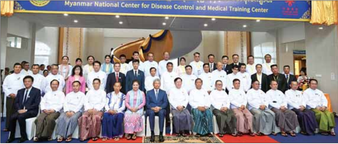
နိုင်ငံတော်စီမံအုပ်ချုပ်ရေးကောင်စီ အတွင်းရေးမှူး ဒုတိယဗိုလ်ချုပ်ကြီး အောင်လင်းဒွေးနှင့် အဖွဲ့ဝင်များ အခမ်းအနားတက်ရောက်လာကြသူများနှင့်အတူ စုပေါင်း မှတ်တမ်းတင်ဓာတ်ပုံရိုက်စဉ်။

ဆက်လက်၍ နိုင်ငံတော်စီမံအုပ်ချုပ် ရေးကောင်စီ အတွင်းရေးမှူးနှင့် အဖွဲ့ သည် မြန်မာနိုင်ငံ ရောဂါကာကွယ် ထိန်းချုပ်ရေးဗဟိုဌာနနှင့် သင်တန်း ကျောင်းရှိ CDC ပြခန်းငယ်၊ မြေညီထပ် ရုံးခန်းများ၊ အစည်းအဝေးခန်းများ၊ ပြည်သူ့ကျန်းမာရေး အရေးပေါ်အခြေ အနေ ကွပ်ကဲရေးဗဟိုဌာန၊ စီဝန်ပုံပြုမှု အဆင့် ဓာတ်ခွဲခန်းများ၊ နည်းပညာသုံး