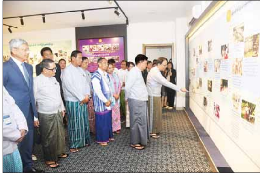
နိုင်ငံတော်စီမံအုပ်ချုပ်ရေးကောင်စီ အတွင်းရေးမှူး ဒုတိယဗိုလ်ချုပ်ကြီး အောင်လင်းဒွေးနှင့် အဖွဲ့ဝင်များ ခင်းကျင်းပြသထားသည့် ပြခန်းများကို လှည့်လည်ကြည့်ရှုစဉ်။

ပိုမိုထိရောက်စွာဆောင်ရွက်လာနိုင် ယခုဌာနကြီးကို ဗဟိုပြု၍ မြန်မာနိုင်ငံတစ်ဝန်းလုံးတွင် ဖြစ်ပွားလာနိုင်သည့် သဘာဝဘေးအန္တရာယ်အမျိုးမျိုးနှင့် ပြည်သူ့ကျန်းမာရေး အရေးပေါ်အခြေအနေများကို ကြိုတင်ကာကွယ်ခြင်းနှင့် တုံ့ပြန်ထိန်းချုပ်နိုင်ခြင်း၊ ကျန်းမာရေး