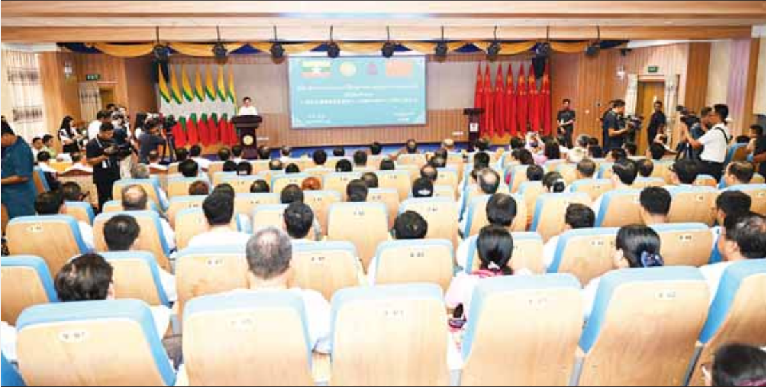
နိုင်ငံတော်စီမံအုပ်ချုပ်ရေးကောင်စီဥက္ကဋ္ဌ နိုင်ငံတော်ဝန်ကြီးချုပ် ကိုယ်စား နိုင်ငံတော်စီမံအုပ်ချုပ်ရေးကောင်စီ အတွင်းရေးမှူး ဒုတိယဗိုလ်ချုပ်ကြီး အောင်လင်းဒွေး မြန်မာနိုင်ငံ ရောဂါကာကွယ်ထိန်းချုပ်ရေးဗဟိုဌာနနှင့် သင်တန်းကျောင်း (Myanmar National Center for Disease Control and Medical Training Center) ဖွင့်ပွဲအခမ်းအနားတွင် အမှာစကားပြောကြားစဉ်။

ထို့နောက် နိုင်ငံတော်စီမံအုပ်ချုပ်ရေး ကောင်စီဥက္ကဋ္ဌ နိုင်ငံတော်ဝန်ကြီးချုပ် ကိုယ်စား နိုင်ငံတော်စီမံအုပ်ချုပ်ရေး ကောင်စီ အတွင်းရေးမှူး ဒုတိယဗိုလ်ချုပ် ကြီး အောင်လင်းဒွေးက မြန်မာနိုင်ငံ ရောဂါကာကွယ်ထိန်းချုပ်ရေးဗဟိုဌာန နှင့် သင်တန်းကျောင်း အဆောက်အအုံကို စက်ဝလုတ်နှိပ် ဖွင့်လှစ်ပေးသည်။