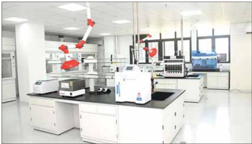
မြန်မာနိုင်ငံရောဂါကာကွယ်ထိန်းချုပ်ရေးဗဟိုဌာနနှင့် သင်တန်းကျောင်းအတွင်း ပြင်ဆင်ထားရှိမှုများကို တွေ့ရစဉ်။

တစ်ပြေးညီ ဆောင်ရွက်နိုင်ခဲ့သည်။ ထို့ပြင် ၂၀၂၀ ပြည့်နှစ်မှစ၍ ကဏ္ဍ အသီးသီးတွင် ကူးစက်ဖြစ်ပွားခဲ့သော ကိုဗစ်-၁၉ ကမ္ဘာ့ကပ်ရောဂါနှင့်ပတ်သက်၍ မြန်မာနိုင်ငံအနေဖြင့် ကိုဗစ်-၁၉ ရောဂါ ကာကွယ်ထိန်းချုပ်၊ ကုသရေးဗဟို ကော်မတီ၏ လမ်းညွှန်မှု၊ ကိုဗစ်-၁၉ ရောဂါထိန်းချုပ်ရေးနှင့် အရေးပေါ် တုံ့ပြန်ရေး ကော်မတီ၏ ကြီးကြပ်မှုတို့ဖြင့် အောင်မြင်စွာ ထိန်းချုပ်ဆောင်ရွက်နိုင် ခဲ့သည်။ ၂၀၂၁ ခုနှစ်တွင် မြန်မာနိုင်ငံ ရောဂါ ကာကွယ်ထိန်းချုပ်ရေး ဗဟိုဌာနနှင့် သင်တန်းကျောင်း မြန်မာ CDC အဆောက်အဦကို မြန်မာနိုင်ငံနှင့် တရုတ်ပြည်သူ့ သမ္မတနိုင်ငံတို့၏ ချစ်ကြည်ရေးသင်္ကေတ အဖြစ် စတင်တည်ဆောက်ခဲ့ရာ ၂၀၂၄ ခုနှစ် မေလတွင် တည်ဆောက်ပြီးစီးပြီ ဖြစ်၍ ဇူလိုင် ၁၃ ရက်တွင် အောင်မြင်စွာ ဖွင့်လှစ်နိုင်ခဲ့ပြီဖြစ်သည်။