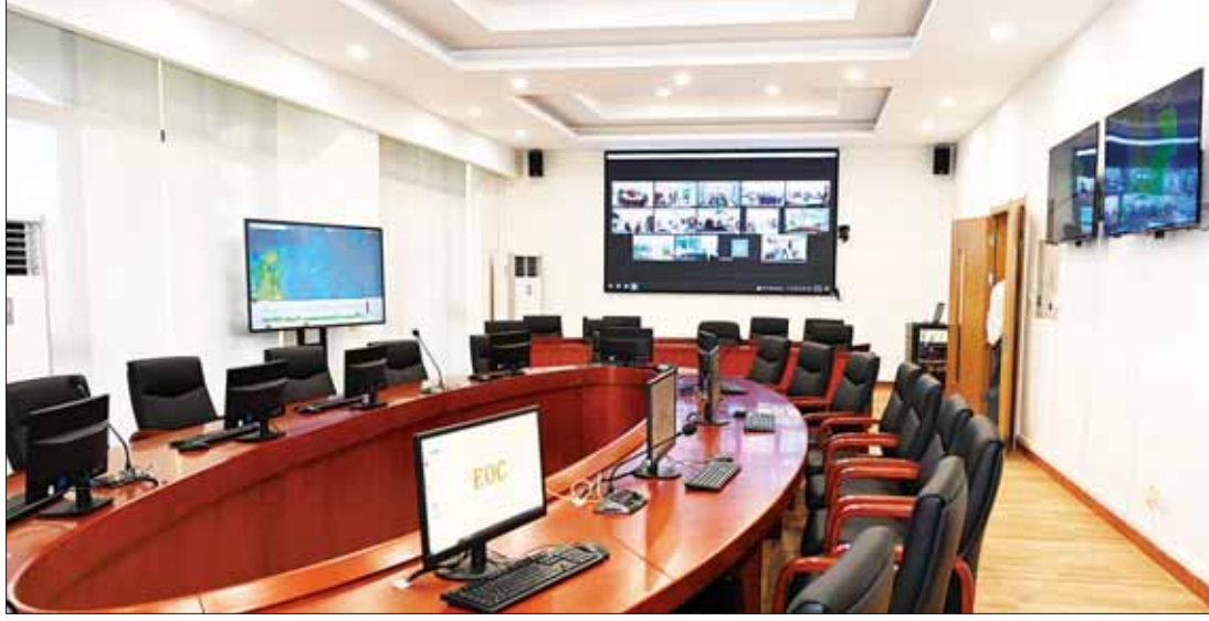
မြန်မာနိုင်ငံရောဂါကာကွယ်ထိန်းချုပ်ရေးဗဟိုဌာနနှင့် သင်တန်းကျောင်းအတွင်း ပြင်ဆင်ထားရှိမှုများကို တွေ့ရစဉ်။

Communications Construction တရုတ်ပြည်သူ့သမ္မတနိုင်ငံ သံအမတ်ကြီး Company-Third Harbor Engineering မစ္စတာချန်းဟိုင်က Myanmar CDC and Medical Training Center နှင့်ပတ်သက်၍ များ၊ ပညာရပ်ပိုင်းနှင့် နည်းပညာပိုင်း ကာကွယ်ထိန်းချုပ်ရေး ဗဟိုဌာနနှင့် သင်တန်းကျောင်း မှတ်တမ်းဖိဒီယိုကို ပြသသည်။ ဂုဏ်ပြုမှတ်တမ်းလွှာပေးအပ် ထိုမှတစ်ဆင့် မြန်မာနိုင်ငံဆိုင်ရာ တရုတ် ပြည်သူ့သမ္မတနိုင်ငံ သံအမတ်ကြီးက မြန်မာနိုင်ငံ ရောဂါကာကွယ်ထိန်းချုပ်ရေး ဗဟိုဌာနနှင့် သင်တန်းကျောင်းအဆောက် အဦဆိုင်ရာ စာရွက်စာတမ်းများကို ကျန်းမာရေးဝန်ကြီးဌာန ပြည်ထောင်စု ဝန်ကြီးထံ လွှဲပြောင်း ပေးအပ်ရာ ပြည်ထောင်စုဝန်ကြီးက ဂုဏ်ပြုမှတ်တမ်း လွှာ ပြန်လည်ပေးအပ်သည်။ ဆက်လက်၍ ကျန်းမာရေးဝန်ကြီး ဌာန ပြည်ထောင်စုဝန်ကြီးနှင့် ဒုတိယ ဝန်ကြီးတို့က နိုင်ငံတော်စီမံအုပ်ချုပ်ရေး ကောင်စီ အတွင်းရေးမှူး၊ မြန်မာနိုင်ငံ ဆိုင်ရာ တရုတ်ပြည်သူ့သမ္မတနိုင်ငံ သံအမတ်ကြီးနှင့် တရုတ်ပြည်သူ့သမ္မတ နိုင်ငံမှ ကိုယ်စားလှယ်အဖွဲ့ ခေါင်းဆောင် တို့ကို ဖွင့်ပွဲအထိမ်းအမှတ် လက်ဆောင် များ ပေးအပ်ကြသည်။ ကျန်းမာရေးဝန်ကြီးဌာနအနေဖြင့် ပြည်သူ့ကျန်းမာရေး စောင့်ရှောက်မှု လုပ်ငန်းများကို စဉ်ဆက်မပြတ် ဆောင် ရွက်လျက်ရှိရာ ၂၀၂၄ ခုနှစ်တွင် မြန်မာ နိုင်ငံ၌ ကုသရေး၊ ကူးစက်ရောဂါများ ကာကွယ်နှိမ်နင်းရေး၊ ကာကွယ်ဆေးထိုး ခြင်းနှင့် ပတ်ဝန်းကျင် သန့်ရှင်းရေး လုပ်ငန်းများ စာမျက်နှာ ၆ သို့