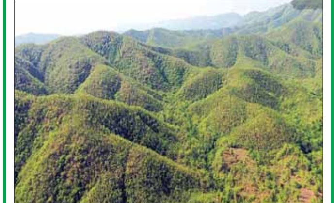
ကေလာသတောင် ကြိုးပြင်ကာကွယ်တော၏ သဘာဝရှုခင်းပုံ။