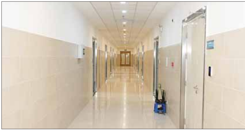
မြန်မာနိုင်ငံရောဂါကာကွယ်ထိန်းချုပ်ရေးဗဟိုဌာနနှင့် သင်တန်းကျောင်းအတွင်း ပြင်ဆင်ထားရှိမှုများကို တွေ့ရစဉ်။

လေနှင့် အသက်ရှူလမ်းကြောင်းမှ တစ်ဆင့် ကူးစက်တတ်သောရောဂါများ စစ်ဆေးနိုင်သည့် နိုင်ငံတကာအဆင့်မီ စီလုပ်ခြုံမှု အဆင့်(၃) ဓာတ်ခွဲခန်း၊ အသင့်အတင့် ကူးစက်နိုင်ခြေရှိသည့် မိုင်းရပ်စ်နှင့် ဗက်တီးရီးယားများကို စစ်ဆေးနိုင်သော စီလုပ်ခြုံမှုအဆင့် (၂) ဓာတ်ခွဲခန်းများ၊ ဓာတ်ခွဲခန်းမှတစ်ဆင့် ကူးစက်နိုင်ခြေနည်းပါးသည့်အစားအသောက်များတွင် ကူးစက်ရောဂါပိုး ပါဝင်မှု၊ မျိုးမပွားနိုင်သည့် မိုင်းရပ်စ်အပိုင်းများ၊ ကပ်ပါးပိုးများ စစ်ဆေးနိုင်သည့် စီလုပ်ခြုံမှုအဆင့် (၁) ဓာတ်ခွဲခန်းများနှင့် လူကို အဆိပ်သင့်နိုင်သည့် ပတ်ဝန်းကျင်ရှိဓာတ်ပစ္စည်းများကို စစ်ဆေးနိုင်သည့် ဓာတ်ခွဲခန်း၊ ဓာတ်အဆိပ်များကို စစ်ဆေးနိုင်သည့် ဓာတ်ခွဲခန်း၊ သွေး၊ သွေးရည်ကြည်နှင့် ဓာတ်ခွဲခန်း၊ မကျွေးစစ်ဆေးနိုင်သည့် ဓာတ်ခွဲခန်း၊ electron microscopy၊ gas နှင့် liquid များကို စစ်ဆေးနိုင်သည့် ဓာတ်ခွဲခန်းများ ပါရှိသည်။