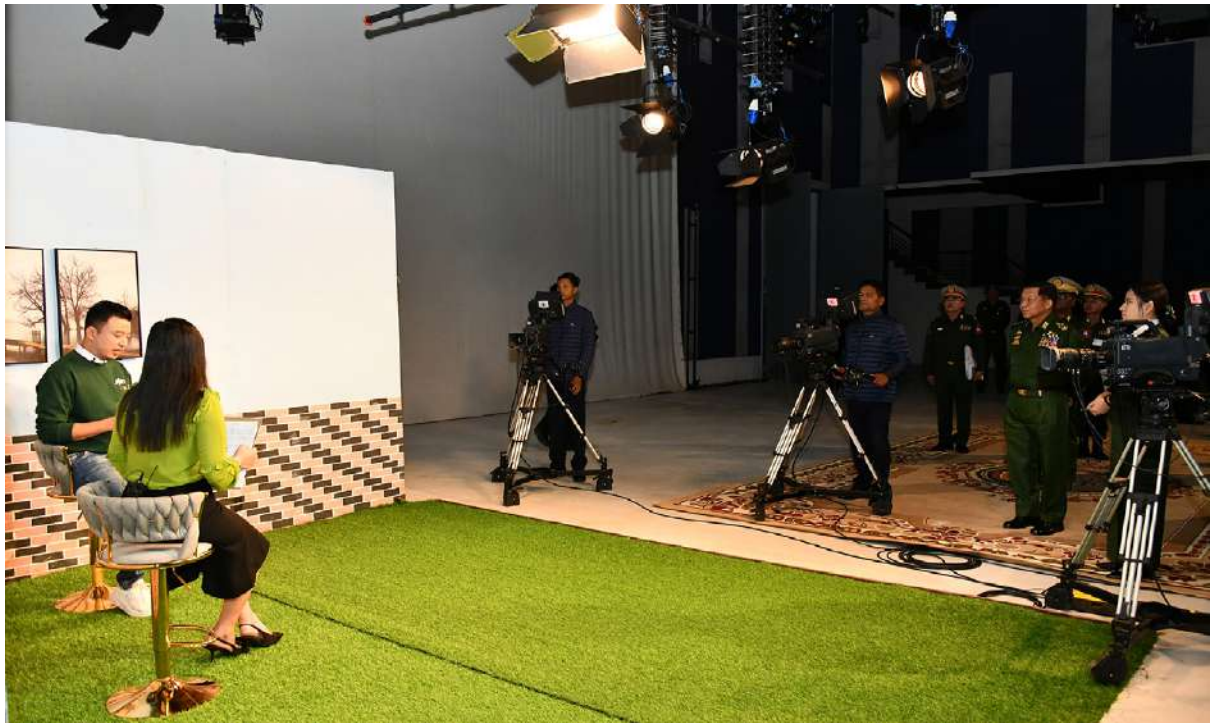
နိုင်ငံတော်စီမံအုပ်ချုပ်ရေးကောင်စီဥက္ကဋ္ဌ တပ်မတော်ကာကွယ်ရေးဦးစီးချုပ် ဗိုလ်ချုပ်မှူးကြီးမင်းအောင်လှိုင် တပ်မတော် ရုပ်မြင်သံကြားထုတ်လွှင့်ရေးတပ်(တောင်ညို)အတွင်း ကျန်းမာရေးအသိပညာပေးအစီအစဉ် သရုပ်ပြရိုက်ကူးမှုနှင့် လုပ်ငန်းဆောင်ရွက်မှု အခြေအနေများကို လှည့်လည်ကြည့်ရှုစစ်ဆေးစဉ်။

နိုင်ကြခြင်းဖြစ်သဖြင့် အများသူငါလုပ်ဆောင် နိုင်ရန်ခက်ခဲသည့် တပ်မတော်သားဘဝကို ဂုဏ်ယူတန်ဖိုးထားကြရန်လိုကြောင်း၊ နိုင်ငံ နှင့် ပြည်သူတို့အတွက် မြင့်မြတ်လှသည့် တာဝန်များကို ထမ်းဆောင်နေရသည့် မိမိတို့ တပ်မတော်သားများ၏ဘဝကို ဂုဏ်ယူ တတ်ရန်နှင့် ပေးအပ်လာသည့်တာဝန်များကို ကျေပွန်စွာထမ်းဆောင်သွားရန်လိုကြောင်း။ စည်းကမ်းဆိုသည်မှာ လုပ်သင့်လုပ်ထိုက် သည်များကို လုပ်ဆောင်ရန်တိုက်တွန်းခြင်း နှင့် မဖြစ်သင့်သည်များကို မလုပ်ဆောင်ရန် တားမြစ်ခြင်းပင်ဖြစ်ကြောင်း၊ တပ်မတော် တွင် ထုတ်ပြန်ထားသည့်စည်းကမ်းများကို လိုက်နာ၍ စစ်သားကောင်းတစ်ယောက် ပီသစွာ နေထိုင်ကျင့်ကြံမည်ဆိုပါက မိမိတို့ တာဝန်ထမ်းဆောင်နေရသည့်ပတ်ဝန်းကျင် တွင် စိတ်လက်ပျော်ရွှင်စွာဖြင့်တာဝန်များကို ကျေပွန်စွာဖြင့် ထမ်းဆောင်နိုင်မည်ဖြစ် ကြောင်း၊ မကြာမီတွင် စာမေးပွဲဖြေဆိုသည့် ကာလသို့ ရောက်ရှိတော့မည်ဖြစ်သဖြင့် ကျောင်းသား၊ ကျောင်းသူများ စာမေးပွဲကို စိတ်အေးချမ်းသာစွာဖြင့် ဖြေဆိုနိုင်ရေး လိုအပ်သည်များ ဆောင်ရွက်ပေးသွားရန် လိုကြောင်း၊ နွေရာသီကျောင်းပိတ်ရက်များ တွင်လည်း လူငယ်နှင့်ပတ်သက်သည့် သင်တန်းများ၊ အမျိုးသားရေးစရိုက်လက္ခဏာ ကိုတိုးမြှင့်လာစေပြီး အသိပညာဗဟုသုတ