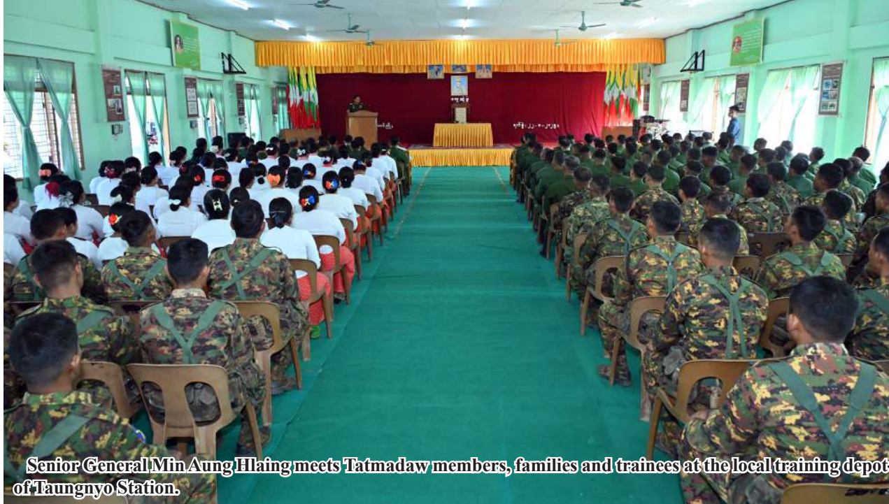
Senior General Min Aung Hlaing meets Tatmadaw members, families and trainees at the local training depot of Taungnyo Station.