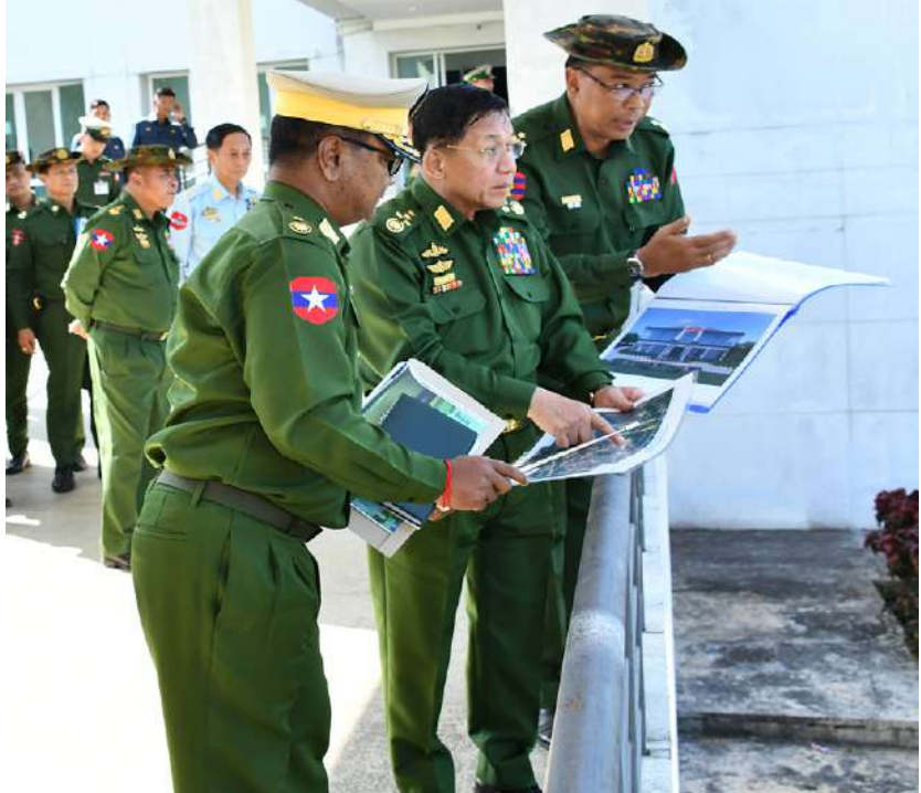
နိုင်ငံတော်စီမံအုပ်ချုပ်ရေးကောင်စီဥက္ကဋ္ဌ တပ်မတော်ကာကွယ်ရေးဦးစီးချုပ် ဗိုလ်ချုပ်မှူးကြီးမင်းအောင်လှိုင် ရုပ်သံပြတိုက်တည်ဆောက်ရန် မြေနေရာလျာထားမှုအား ကြည့်ရှုစစ်ဆေးစဉ်။

ဆောင်ရွက်၍ရနိုင်မည်ကို ဆန်းစစ် လေ့လာဆောင်ရွက်ခြင်းဖြင့် လုပ်ငန်း ရပ်ကြီးတစ်ခုလုံးတိုးတက်အောင် ဆောင် ရွက်သွားရန်လိုကြောင်းဖြင့် ပြောကြားပြီး တပ်တည်ဆောက်ရေး လုပ်ငန်းရပ်များ ဖြစ်သည့် “လေ့ကျင့်ရေး၊ အုပ်ချုပ်ရေး၊ သက်သာချောင်ချိရေး၊ စိတ်ဓာတ်”တို့နှင့် ပတ်သက်၍ အကျယ်တဝင့်ရှင်းလင်း မှာကြားသည်။ တွေ့ဆုံပွဲအပြီးတွင် နိုင်ငံတော်စီမံ အုပ်ချုပ်ရေးကောင်စီဥက္ကဋ္ဌ တပ်မတော်