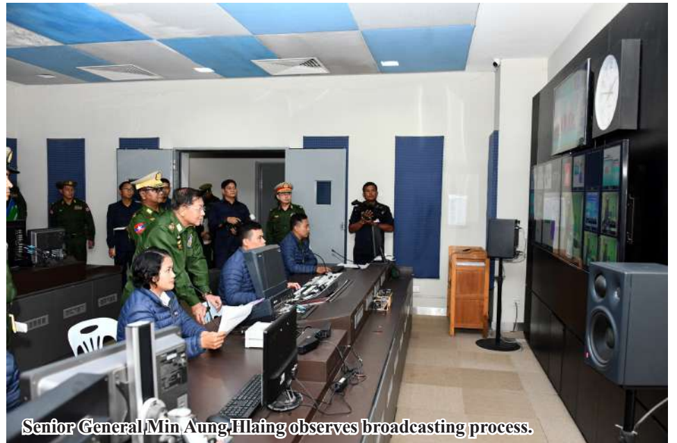
Senior General Min Aung Hlaing observes broadcasting process.

It is necessary to carry out TV broadcasting operations broad-mindedly and to perform duties in the interests of the county by broadcasting good concepts and knowledge necessary for the public. Wisdom and knowledge must be learnt and shared constantly. Broadcasting TV involves images and sound and care must be taken so that sound is correct and images are clear and flexible. Moreover, healthy habits must be cultivated. It is necessary to improve one's tasks by finding out ways and means for development of the entire operation. In conclusion, the Senior General discussed