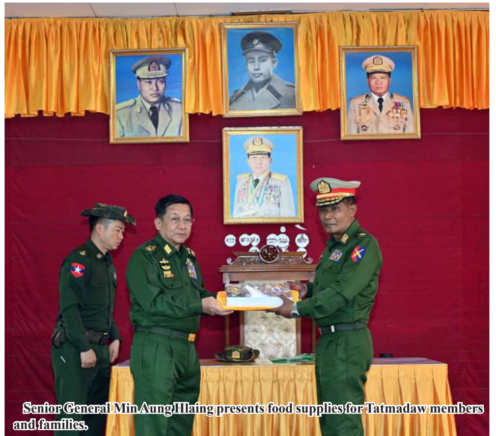
Senior General Min Aung Hlaing presents food supplies for Tatmadaw members and families.

Subsequently, the Senior General and party visited the