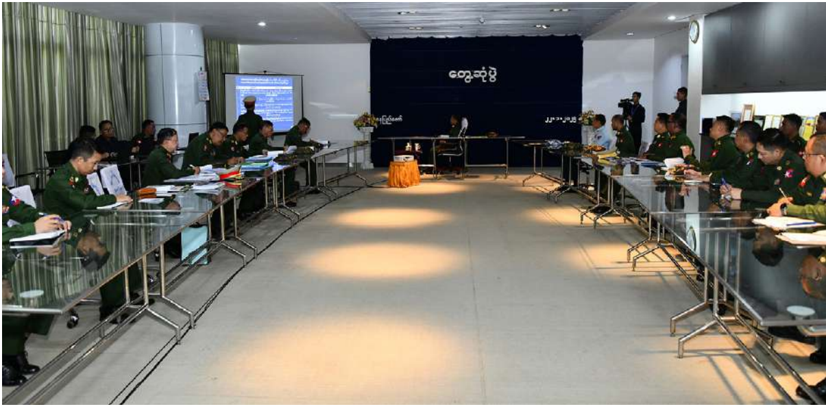
နိုင်ငံတော်စီမံအုပ်ချုပ်ရေးကောင်စီဥက္ကဋ္ဌ တပ်မတော်ကာကွယ်ရေးဦးစီးချုပ် ဗိုလ်ချုပ်မှူးကြီးမင်းအောင်လှိုင်အား တပ်မတော် ရုပ်မြင်သံကြားထုတ်လွှင့်ရေးတပ်(တောင်ညို)တပ်မှူးက နေ့စဉ်ပြည်တွင်းပြည်ပ သတင်းများအပါအဝင် အခြားသောဗဟုသုတဖြစ်ဖွယ်၊ စိတ်ဝင်စားဖွယ်အစီအစဉ်များစွာကို ထုတ်လွှင့်ပေးလျက်ရှိမှုတို့နှင့်ပတ်သက်၍ ရှင်းလင်းတင်ပြစဉ်။

တပ်မတော်သားများသည် မည်သူ တစ်ဦးတစ်ယောက်၏ တိုက်တွန်းချက်မျှမပါ ရှိဘဲ နိုင်ငံတော်ကာကွယ်ရေးနှင့် လုံခြုံရေး တာဝန်များကိုထမ်းဆောင်ရန် တပ်မတော် အတွင်းသို့ ဝင်ရောက်အမှုထမ်းခဲ့ကြခြင်းဖြစ်ကြောင်း၊ မိမိတို့တပ်မတော်သားများသည် နိုင်ငံနှင့်ပြည်သူအကျိုးအတွက် စွန့်လွှတ် စွန့်စားခြင်းများစွာဖြင့် ပေးအပ်လာသည့် တာဝန်များကို ကျေပွန်အောင်ထမ်းဆောင် ခဲ့ကြကြောင်း၊ အရာရှိ စစ်သည်များအနေဖြင့် ရှေ့တန်းစစ်မြေပြင်တွင် နိုင်ငံတော်ကာကွယ် ရေးနှင့် လုံခြုံရေးတာဝန်များကို ရွပ်ရွပ်ချွံချွံ ထမ်းဆောင်လျက်ရှိသကဲ့သို့ မိသားစုများ အနေဖြင့်လည်း မိမိတို့သက်ဆိုင်ရာ တပ်များ အလိုက် လိုက်လံနေထိုင်၍ ပါရမီဖြည့်လျက် ရှိကြကြောင်း၊ ထိုကဲ့သို့ နိုင်ငံတော်ကာကွယ် ရေးနှင့် လုံခြုံရေးတာဝန်ထမ်းဆောင်နေကြ သူများအားလုံး၏ နိုင်ငံတော်နှင့် ပြည်သူ လူထုအတွက် တာဝန်ထမ်းဆောင်နေမှုများ ကိုလည်း မိမိအနေဖြင့် အသိအမှတ်ပြု ဂုဏ်ပြုပါကြောင်း၊ မိမိတို့နိုင်ငံ၏ လက်ရှိ လူဦးရေသည် ၅၂ သန်းခန့်ရှိပြီး အမျိုးသား ၄၇ ရာခိုင်နှုန်းနှင့် အမျိုးသမီး ၅၃ ရာခိုင်နှုန်း ခန့်ရှိကြောင်း၊ ၎င်းအနက် လူဦးရေ အနည်းငယ်သာ တပ်မတော်သားဘဝကို ခံယူ၍ မွန်မြတ်လှသည့် နိုင်ငံတော်ကာကွယ် ရေးနှင့်လုံခြုံရေးတာဝန်များကို ထမ်းဆောင်