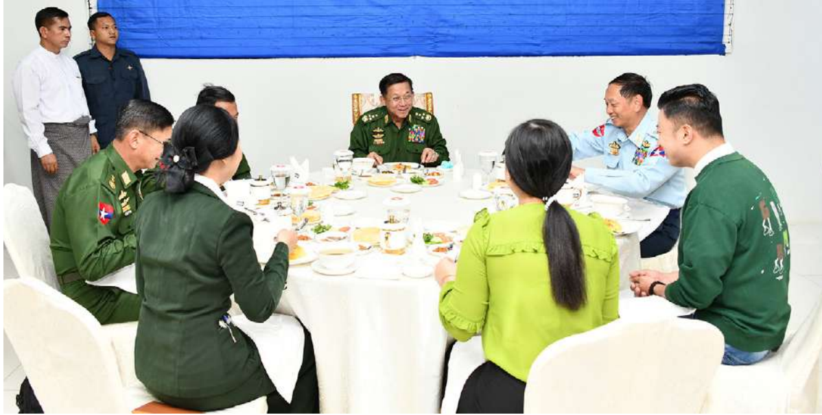
နိုင်ငံတော်စီမံအုပ်ချုပ်ရေးကောင်စီဥက္ကဋ္ဌ တပ်မတော်ကာကွယ်ရေးဦးစီးချုပ် ဗိုလ်ချုပ်မှူးကြီးမင်းအောင်လှိုင်နှင့်အဖွဲ့ဝင်များ တပ်မတော်ရုပ်မြင်သံကြားထုတ်လွှင့်ရေးတပ်(တောင်ညို)မှ အရာရှိ၊ စစ်သည်များ၊ ဝန်ထမ်းများနှင့်အတူ နေ့လယ်စာအတူတကွ သုံးဆောင်စဉ်။

သည်လည်း တိုးတက်လာမည်ဖြစ်ကြောင်း၊ ဖတ်ရှုလေ့လာမှတ်သားခြင်းသည် လုပ်ငန်း တစ်ခုကျွမ်းကျင်ရေးအတွက် များစွာ အထောက်အကူပြုစေမည် ဖြစ်ကြောင်း၊ မိမိတို့ဖတ်ရှုလေ့လာ မှတ်သားထားမှုများ နှင့် အတွေ့အကြုံများကို အပြန်အလှန် ဆက်စပ်နှိုင်းယှဉ်၍ သင်ခန်းစာဖော်ထုတ် သွားရန်လိုကြောင်း။