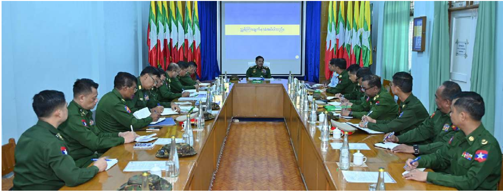
နိုင်ငံတော်စီမံအုပ်ချုပ်ရေးကောင်စီဥက္ကဋ္ဌ တပ်မတော်ကာကွယ်ရေးဦးစီးချုပ် ဗိုလ်ချုပ်မှူးကြီးမင်းအောင်လှိုင် တောင်ညိုတပ်နယ်ရှိ နယ်မြေခံလေ့ကျင့်ရေးသင်တန်းကျောင်း အစည်းအဝေးခန်းမ၌ ကျောင်းအုပ်ကြီး၏ ရှင်းလင်းတင်ပြမှုအပေါ် လိုအပ်သည်များ မှာကြားစဉ်။

ဆောင်ရွက်ကြရမည်ဖြစ်ကြောင်း၊ ထိုသို့ လုပ်ဆောင်ပြီး စစ်စည်းကမ်းကောင်းမွန်၍ အုပ်ချုပ်ထောက်ပံ့မှုများ ကောင်းမွန်မည် ဆိုပါက စိတ်ဓာတ်ပိုင်းဆိုင်ရာတွင်လည်း ကောင်းမွန်ခိုင်မြဲလာမည်ဖြစ်ကြောင်း။