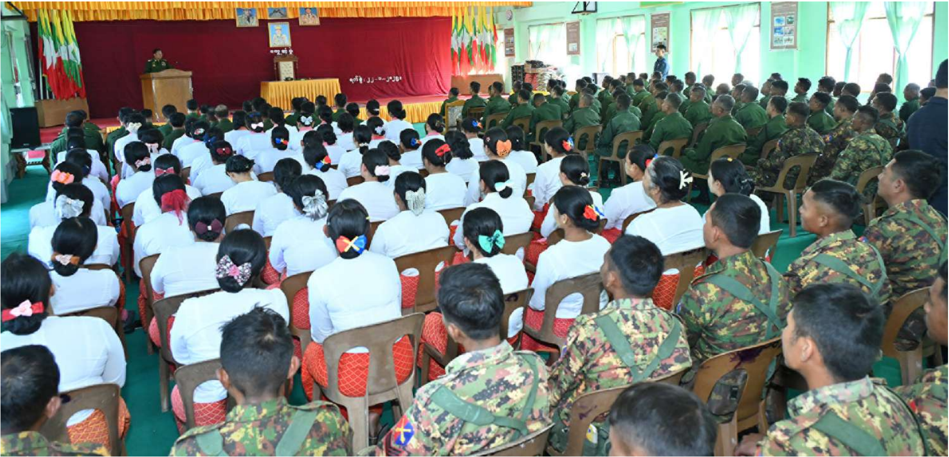
နိုင်ငံတော်စီမံအုပ်ချုပ်ရေးကောင်စီဥက္ကဋ္ဌ တပ်မတော်ကာကွယ်ရေးဦးစီးချုပ် ဗိုလ်ချုပ်မှူးကြီးမင်းအောင်လှိုင် တောင်ညိုတပ်နယ်ရှိ နယ်မြေခံလေ့ကျင့်ရေးသင်တန်းကျောင်းမှ အရာရှိ၊ စစ်သည်၊ မိသားစုများနှင့် သင်တန်းသားများကို တွေ့ဆုံအမှာစကားပြောကြားစဉ်။

တောင်ညိုတပ်နယ်ရှိ နယ်မြေခံလေ့ကျင့်ရေးသင်တန်းကျောင်းနှင့် တပ်မတော်ရုပ်မြင်သံကြားထုတ်လွှင့်ရေးတပ်(တောင်ညို)သို့ သွားရောက်ကြည့်ရှုစစ်ဆေး