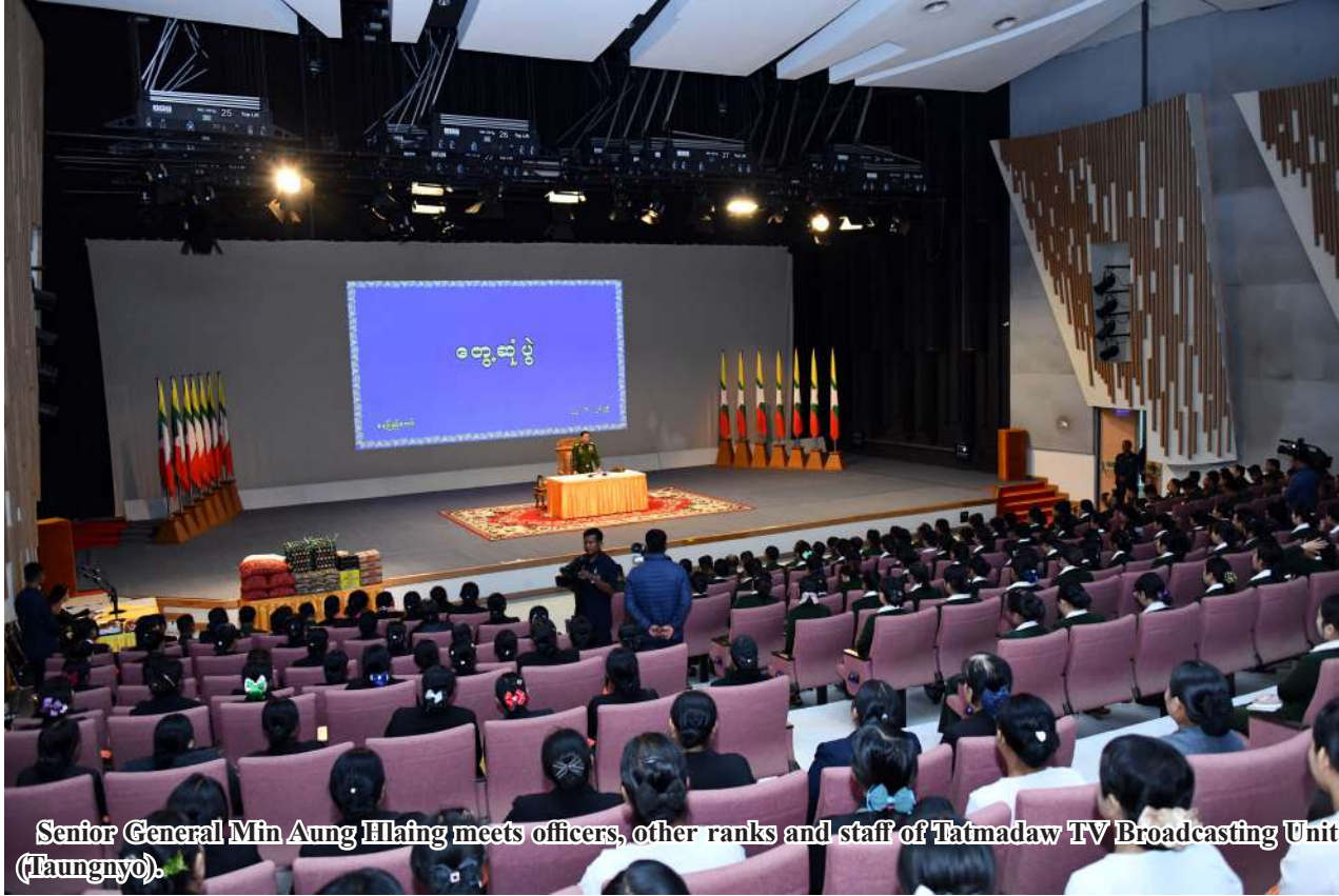
Senior General Min Aung Hlaing meets officers, other ranks and staff of Tatmadaw TV Broadcasting Unit (Taungnyo).