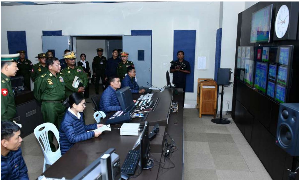
နိုင်ငံတော်စီမံအုပ်ချုပ်ရေးကောင်စီဥက္ကဋ္ဌ တပ်မတော်ကာကွယ်ရေးဦးစီးချုပ် ဗိုလ်ချုပ်မှူးကြီးမင်းအောင်လှိုင် တပ်မတော် ရုပ်မြင်သံကြားထုတ်လွှင့်ရေးတပ်(တောင်ညို)အတွင်း လုပ်ငန်းဆောင်ရွက်နေမှုအခြေအနေများကို လှည့်လည်ကြည့်ရှုစစ်ဆေးစဉ်။

အသက်အရွယ်အလိုက် ကြိုက်နှစ်သက်သည့် အစီအစဉ်များ၊ တေးသီချင်းများ ထုတ်လွှင့် နိုင်ရန်လိုကြောင်း။ ရုပ်မြင်သံကြား ထုတ်လွှင့်ခြင်းလုပ်ငန်း များသည် လူထုဆက်ဆံရေးလုပ်ငန်းတစ်ခု ပင်ဖြစ်ကြောင်း၊ ပြည်သူ့ဆက်ဆံရေးနှင့် စိတ်ဓာတ်စစ်ဆင်ရေးညွှန်ကြားရေးမှူးရုံး၏ ရည်ရွယ်ချက်မှာ "ပြန်ကြားပေးရန်၊ ဖျော်ဖြေ ပေးရန်၊ ပညာပေးရန်နှင့် စည်းရုံးရန်" ဖြစ် ကြောင်း၊ နည်းမှန်လမ်းမှန်ပြန်ကြားပေး ခြင်း၊ ဖျော်ဖြေပေးခြင်းနှင့် ပညာပေးခြင်း တို့ကိုဆောင်ရွက်မှုသည် စည်းရုံးရေးကို ဆောင်ရွက်ခြင်းပင်ဖြစ်ကြောင်း၊ ထို့ကြောင့် အကျိုးရှိအောင်ဆောင်ရွက်ရန်နှင့်အကျိုးပြု သည့်လုပ်ငန်းတစ်ရပ်ဖြစ်အောင် ဆောင်ရွက် ရန်လိုကြောင်း၊ မိမိတို့မသိရှိသေးသည့် အကြောင်းအရာနှင့် အသိပညာဗဟုသုတ များကို ထုတ်လွှင့်ပေးခြင်းသည် ပညာပေး