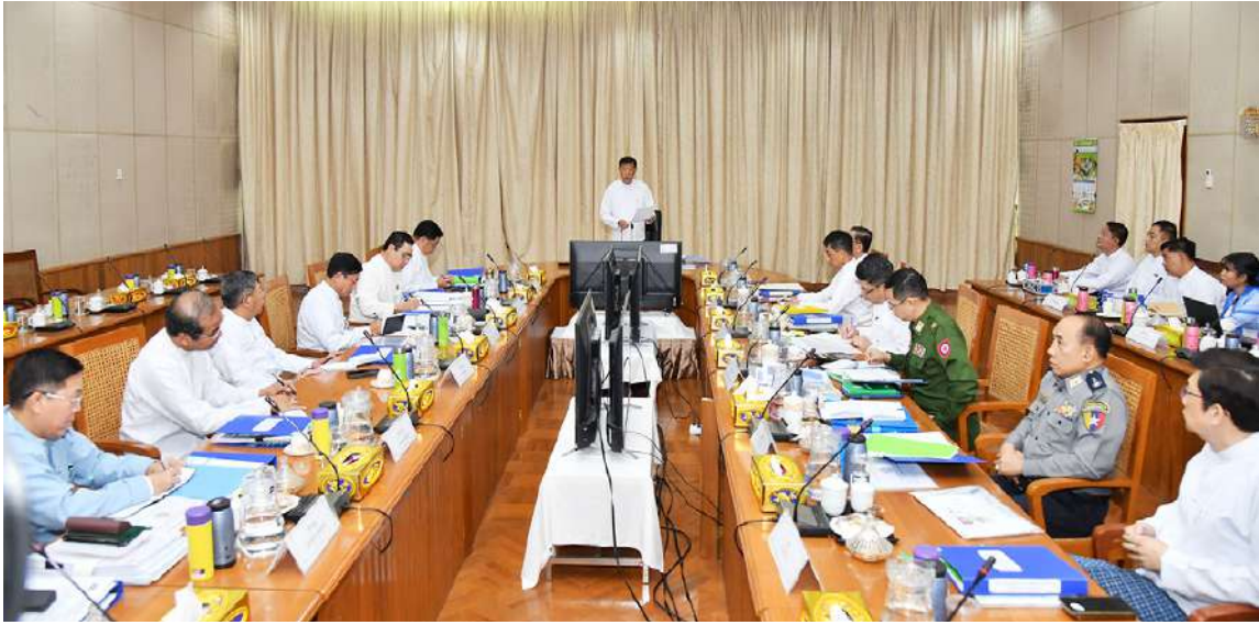
ကော်မတီအဖွဲ့ဝင်များ၊ တာဝန်ရှိသူများ နှင့် အထူးဖိတ်ကြားထားသူများ တက် ရောက်ကြသည်။ ဦးစွာကုန်သွယ်မှုနှင့်ကုန်စည်စီးဆင်း မှုများ မှန်ကန်မြန်ဆန်စေရေး ဗဟို ကော်မတီဥက္ကဋ္ဌ နိုင်ငံတော်စီမံအုပ်ချုပ် ရေးကောင်စီအဖွဲ့ဝင် ဒုတိယဝန်ကြီးချုပ် နှင့် ပြည်ထောင်စုဝန်ကြီး ဗိုလ်ချုပ်ကြီး မြထွန်းဦးက အမှာစကားပြောကြားသည်။

နေပြည်တော် ဇန်နဝါရီ ၂၂ ကုန်သွယ်မှုနှင့်ကုန်စည်စီးဆင်းမှုများ မှန်ကန်မြန်ဆန်စေရေး ဗဟိုကော်မတီ (၁/၂၀၂၅)ကြိမ်မြောက် လုပ်ငန်းညှိနှိုင်း အစည်းအဝေးကို ယနေ့နံနက်ပိုင်းတွင် နေပြည်တော်ရှိ ပြည်ထောင်စုအစိုးရအဖွဲ့ ရုံး၌ကျင်းပရာ ကုန်သွယ်မှုနှင့် ကုန်စည် စီးဆင်းမှုများမှန်ကန်မြန်ဆန်စေရေး ဗဟို ကော်မတီဥက္ကဋ္ဌ နိုင်ငံတော်စီမံအုပ်ချုပ် ရေးကောင်စီအဖွဲ့ဝင် ဒုတိယဝန်ကြီးချုပ် နှင့် ပူးဆောင်ရေးနှင့်ဆက်သွယ်ရေးဝန်ကြီး ဌာန ပြည်ထောင်စုဝန်ကြီး ဗိုလ်ချုပ်ကြီး မြထွန်းဦး တက်ရောက်အမှာစကားပြော ကြားသည်။ အစည်းအဝေးသို့ ကုန်သွယ်မှုနှင့် ကုန်စည်စီးဆင်းမှုများ မှန်ကန်မြန်ဆန်စေ ရေးဗဟိုကော်မတီဒုတိယဥက္ကဋ္ဌ ဗဟို