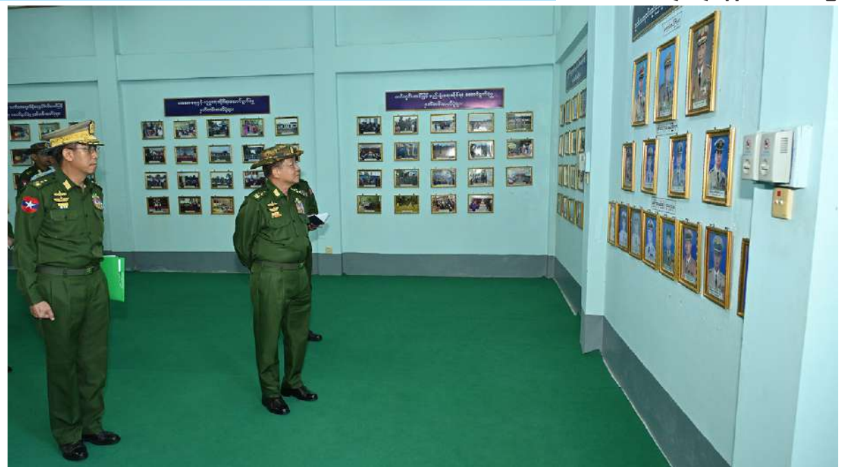
နိုင်ငံတော်စီမံအုပ်ချုပ်ရေးကောင်စီဥက္ကဋ္ဌ တပ်မတော်ကာကွယ်ရေးဦးစီးချုပ် ဗိုလ်ချုပ်မှူးကြီးမင်းအောင်လှိုင် သင်တန်းကျောင်းရှိ ပြခန်းများကို လိုက်လံကြည့်ရှုစစ်ဆေးစဉ်။

ယနေ့ခေတ်သည် နည်းပညာခေတ် ဖြစ်သဖြင့် နည်းပညာကိုအသုံးပြု၍ အင်တာနက်စာမျက်နှာများနှင့် စာအုပ် စာပေများမှ မိမိတို့ဘဝတိုးတက်ရေးအတွက် လိုအပ်သည့် အချက်အလက်များနှင့် ဗဟုသုတများကို ရှာဖွေလေ့လာဆောင်ရွက် မည်ဆိုပါက တစ်ဦးချင်း၏စွမ်းရည်များ