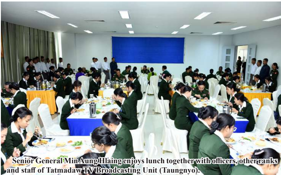
Senior General Min Aung Hlaing enjoys lunch together with officers, other ranks and staff of Tatmadaw TV Broadcasting Unit (Taungnyo).

tors. He urged that all assigned goals and responsibilities should be carried out systematically, addressing every detail, and striving to advance the broadcasting operations.