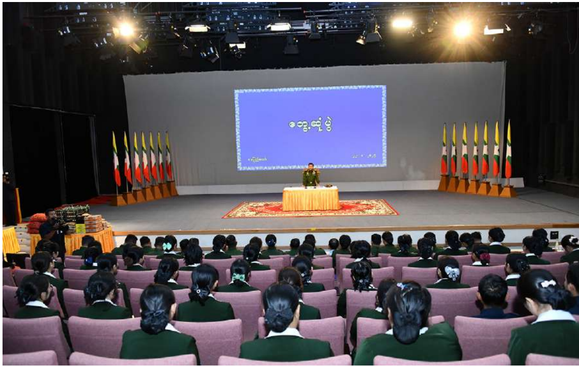
နိုင်ငံတော်စီမံအုပ်ချုပ်ရေးကောင်စီဥက္ကဋ္ဌ တပ်မတော်ကာကွယ်ရေးဦးစီးချုပ် ဗိုလ်ချုပ်မှူးကြီးမင်းအောင်လှိုင် တပ်မတော် ရုပ်မြင်သံကြားထုတ်လွှင့်ရေးတပ်(တောင်ညို)တွင် တာဝန်ထမ်းဆောင်လျက်ရှိသည့် အရာရှိ၊ စစ်သည်များနှင့် ဝန်ထမ်းများအား တွေ့ဆုံအမှာစကားပြောကြားစဉ်။

စာမျက်နှာ ၁၇ မှအဆက် လိုက်လံကြည့်ရှုစစ်ဆေးပြီး ဌာနအလိုက် တာဝန်ရှိသူများ၏ တင်ပြချက်များ အပေါ် လိုအပ်သည်များကို လမ်းညွှန် မှာကြားသည်။ ယင်းနောက် နိုင်ငံတော်စီမံအုပ်ချုပ်ရေး ကောင်စီဥက္ကဋ္ဌ တပ်မတော်ကာကွယ်ရေး ဦးစီးချုပ်သည် ရုပ်သံပြတိုက်တည်ဆောက် ရန် မြေနေရာလျာထားမှုကိုကြည့်ရှု စစ်ဆေးပြီး တာဝန်ရှိသူများ၏ တင်ပြချက်များအပေါ် လိုအပ်သည်များ