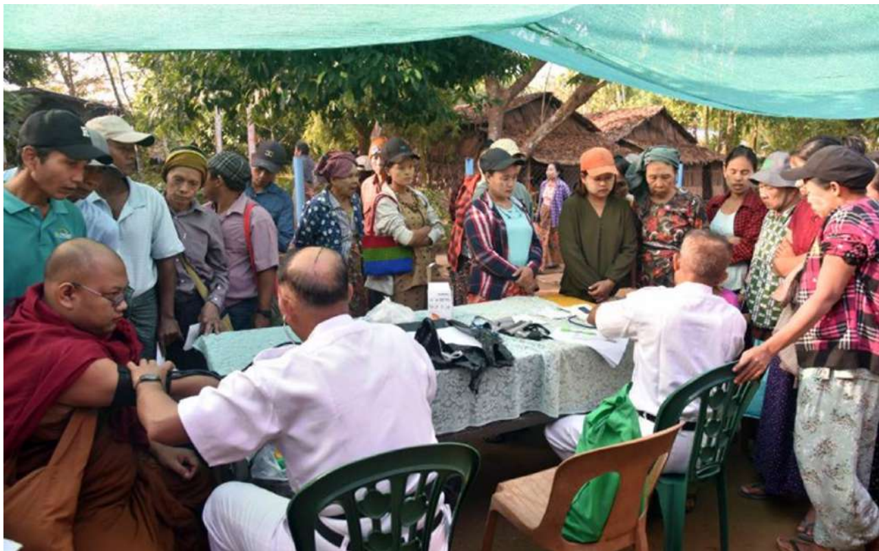
တပ်မတော်မြစ်တွင်းသွားဆေးရုံရေယာဉ်(ရွှေပုဇွန်)နှင့် မြစ်ရေယာဉ်(စကု)တို့မှ နယ်လှည့်အထူးကုဆေးအဖွဲ့က ဧရာဝတီတိုင်းဒေသကြီး ကျိုက်လတ်မြို့နယ် ပတုတ်ကျေးရွာရှိ ဒေသခံပြည်သူများကို ကျန်းမာရေးစောင့်ရှောက်မှုလုပ်ငန်းများ ဆောင်ရွက်ပေးစဉ်။

(ဂ) နိုင်ငံ၏ ဖွံ့ဖြိုးတိုးတက်ရေးလုပ်ငန်းစဉ်များ၌ လူငယ်များအနေဖြင့် အဓိကစွမ်းအားစုအဖြစ် ပါဝင်နိုင်ရေး ဗလငါးတန်နှင့် ပြည့်စုံသော လူငယ်များဖြစ်စေရန် လူငယ်ကဏ္ဍကို မြှင့်တင်ဆောင်ရွက်ရေး။