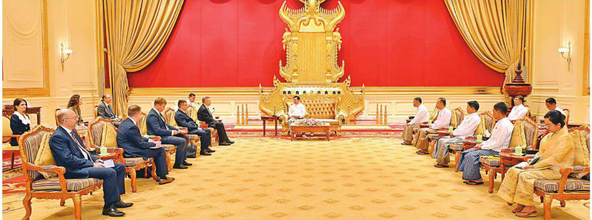
နိုင်ငံတော်စီမံအုပ်ချုပ်ရေးကောင်စီဥက္ကဋ္ဌ နိုင်ငံတော်ဝန်ကြီးချုပ် ဗိုလ်ချုပ်မှူးကြီးမင်းအောင်လှိုင်ထံ ဥရောပအာရှစီးပွားရေးကော်မရှင် ဘုတ်အဖွဲ့ဝင် အကြီးစားစီးပွားရေးနှင့် ပေါင်းစည်းရေးဝန်ကြီး H.E. Mr. Sergei GLAZEV ဦးဆောင်သော ကိုယ်စားလှယ်အဖွဲ့က လာရောက်ဂါရဝပြုတွေ့ဆုံခဲ့။

ဥရောပအာရှစီးပွားရေးကော်မရှင် ဘုတ်အဖွဲ့ဝင် အကြီးစားစီးပွားရေးနှင့်ပေါင်းစည်းရေးဝန်ကြီး ဦးဆောင်သော ကိုယ်စားလှယ်အဖွဲ့က လာရောက်ဂါရဝပြုတွေ့ဆုံ