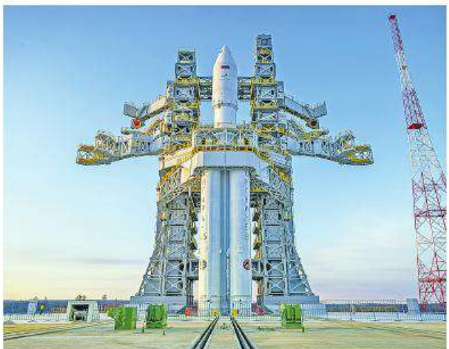
အသုံးပြုရန် စီစဉ်ထားကြောင်း သိရသည်။ Ref : Russia Today Trs : KKO

မော်စကို ဧပြီ ၁၀ ရုရှားအာကာသအေဂျင်စီက အန်ဂါရာ-အေ ၅ အမည်ရှိ ခုံးပျံသစ် စမ်းသပ်လွှတ်တင်ရေးအစီအစဉ်ကို ဧပြီ ၉ ရက်တွင် ပျက်သိမ်းခဲ့ကြောင်း သိရသည်။ ရုရှားအာကာသအေဂျင်စီသည် မူလက အန်ဂါရာ-အေ ၅ ခုံးပျံကို ရုရှားအရှေ့ဖျားဒေသ တော့ချီနို အာကာသစခန်းမှ တစ်ဆင့် ဧပြီ ၉ ရက်တွင် လွှတ်တင်ရန် စီစဉ်ထားသည်။ သို့ရာတွင် ရုရှားအာကာသအေဂျင်စီအနေဖြင့် ခုံးပျံလောင်စာကန် ဖိအားပေးမှုစနစ်ပြဿနာ တစ်ရပ်ကြောင့် လွှတ်တင်ရန် နှစ်မိနစ်အလိုတွင် လွှတ်တင်ရေးအစီအစဉ်ကို ပျက်သိမ်းခဲ့ခြင်းဖြစ်သည်။ ရုရှားအာကာသအေဂျင်စီသည် အန်ဂါရာ-အေ ၅ ခုံးပျံကို လွှတ်တင်ရေးအတွက် ဧပြီ ၁၂ ရက်တွင် ကြိုးပမ်းမည်ဖြစ်ကြောင်း သိရသည်။ ရုရှားအာကာသအေဂျင်စီသည် အန်ဂါရာ-အေ ၅ ခုံးပျံများကို ယခင်က သုံးကြိမ်ထိ စမ်းသပ်လွှတ်တင်ခဲ့ပြီးဖြစ်သည်။ ရုရှားနိုင်ငံသည် အန်ဂါရာ-အေ ၅ ခုံးပျံများကို ဆိုဗီယက်ခေတ် ပရိုတွန်ခုံးပျံများနေရာတွင် အစားထိုး