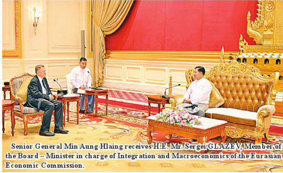
Senior General Min Aung Hlaing receives H.E. Mr. Sergei GLAZEV, Member of the Board – Minister in charge of Integration and Macroeconomics of the Eurasian Economic Commission.

Nay Pyi Taw April 10 Chairman of the State Administration Council Prime Minister Senior General Min Aung Hlaing received a delegation led by H.E. Mr. Sergei GLAZEV, Member of the Board – Minister in charge of Integration and Macroeconomics of the Eurasian Economic Commission, at