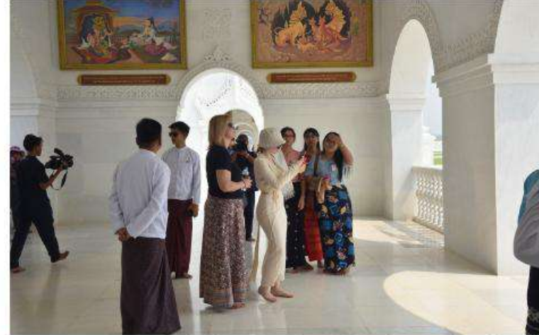
ဥရောပအာရှစီးပွားရေးကော်မရှင်ဘုတ်အဖွဲ့ဝင် အကြီးစားစီးပွားရေးနှင့် ပေါင်းစည်း ရေးဝန်ကြီး H.E. Mr. Sergei GLAZEV ၏ဇနီးနှင့် တာဝန်ရှိသူများ ဂန္ဓကုဋ်တိုက် အတွင်း ကြည့်ရှုလေ့လာစဉ်

ထို့အတူ မာရဝိဇယဗုဒ္ဓရုပ်ပွားတော်မြတ် ကြီးအား အနယ်နယ်အရပ်ရပ်မှ ရဟန်းရှင် လူဘုရားဖူးပြည်သူများလည်း လာရောက် ဖူးမြော် ကြည်ညိုလျက်ရှိကြောင်း သတင်း ရရှိသည်။