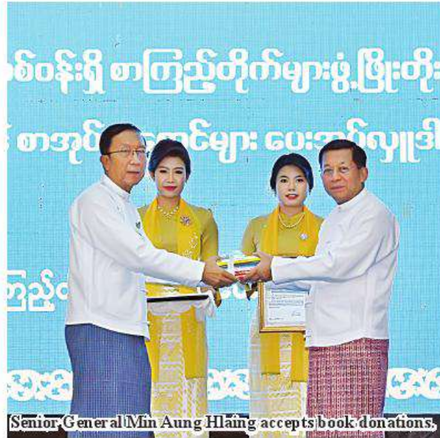
Senior General Min Aung Hlaing accepts book donations.

Library is a institute to disseminate knowledge. It is necessary to organize the people to read and raise reading habit. Individuals need to read books for accumulate knowledge. They have to note down knowledge from the books not just for reading. Reading can accumulate knowledge, benefiting the life. Moreover, readers have to discuss and talk about thing they have read for dissemination of knowledge. Hence, it is necessary to hold seminars in relevant wards and villages weekly or monthly. The Myanmar proverb mentions one morning for water and seven days for food.