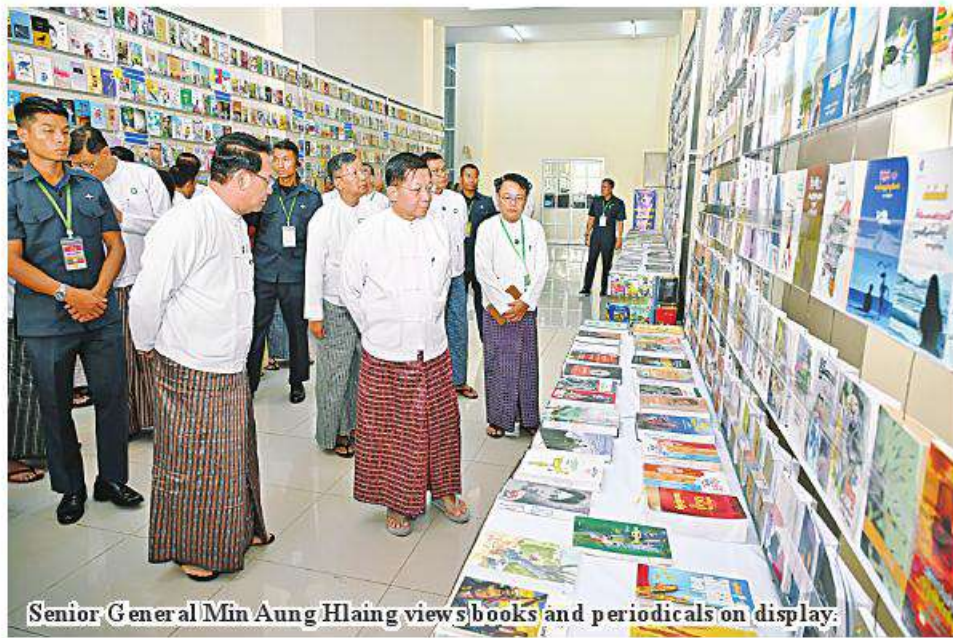
Senior General Min Aung Hlaing views books and periodicals on display.

From Page 12 It is necessary to strive for changing their lifestyle and shaping the wise society in the future. In so doing, it must be a long term plan not a just short term plan. The government is im-