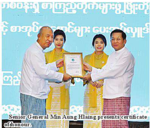
Senior General Min Aung Hlaing presents certificate of honour.

Likewise, lack of literary knowledge will be difficulties along the life. Due to lack of literary knowledge and weak knowledge, many people face difficulties in daily routine. See Page 13