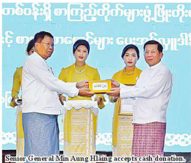
Senior General Min Aung Hlaing accepts cash donation.