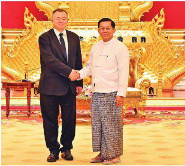
နိုင်ငံတော်စီမံအုပ်ချုပ်ရေးကောင်စီဥက္ကဋ္ဌ ခိုင်ငံတော်ဝန်ကြီးချုပ် ဝိုလ်ချုပ်မျိုးကြီးမင်းအောင်လှိုင် ဥရောပအာရှစီးပွားရေးကော်မရှင် ဘုတ်အဖွဲ့ဝင် အကြီးစားစီးပွားရေးနှင့် ပေါင်းစည်းရေးဝန်ကြီး H.E. Mr. Sergei GLAZEV အား ရင်းရင်းနှီးနှီးနှုတ်ဆက်စဉ်။