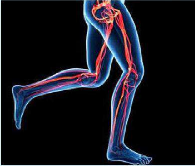
မိမိတို့ရဲ့ ခန္ဓာကိုယ်မှာ ကြွက်သားတွေကလည်း ပိုမို အဆီပိုတွေ မရှိတော့ဘူးဆိုရင် ပေါ်လွင်လာပြီး သန်မာလာမှာ

ဖြစ်ပါတယ်။ ဒီလို ဖြစ်ချင်တယ်ဆိုရင် တော့ တစ်ရက်ကို ခြေလှမ်းရေ ၁၀၀၀၀ လောက် လမ်းလျှောက် ပေးရုံနဲ့တင် ရရှိနိုင်ပါတယ်။ ဒီထက်ပိုပြီး ပြင်းထန်တဲ့ လေ့ကျင့်ခန်းမျိုးလိုချင်တယ်ဆို ရင်တော့ တောင်တက်လမ်း လျှောက်ခြင်းကိုလည်း ကြိုးစား ကြည့်သင့်ပါတယ်။ ဒါ့အပြင် စက္ကန့် ၃၀ မှ ၁ မိနစ်၊ ၂ မိနစ်အထိ ခပ်မြန်မြန်လမ်း လျှောက်ပြီး ပုံမှန်လမ်းပြန် လျှောက်ခြင်း၊ အဲဒီနောက် ခပ် မြန်မြန်ပြန်ပြီး လမ်းလျှောက်ခြင်း လိုမျိုး လေ့ကျင့်ခန်းတွေကလည်း ထိရောက်မှုရှိလှပါတယ်။ လမ်းလျှောက်ခြင်းဟာ သင့် ခန္ဓာကိုယ်တစ်လျှောက်မှာရှိတဲ့ ကြွက်သားတွေရဲ့ တင်းအားကို တိုးမြှင့်စေတာသာဖြစ်ပါတယ်။ လမ်းလျှောက်ခြင်းဟာ ပြင်း ထန်တဲ့ လေ့ကျင့်ခန်းမဟုတ်တဲ့ အတွက် ကြွက်သားတွေနာကျင် ခြင်းမရှိစေပါဘူး။ ဒါကြောင့် အနာတရဖြစ်တာမျိုး၊ နောက် တစ်ခေါက် လမ်းလျှောက်ဖို့ အတွက် ကြွက်သားတွေနာလို့ မလျှောက်နိုင်တာမျိုးလည်း မဖြစ် စေပါဘူး။