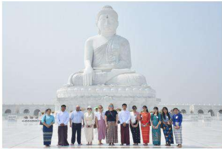
မာရဝိဇယဗုဒ္ဓရုပ်ပွားတော်မြတ်ကြီးအား ဥရောပအာရှစီးပွားရေးကော်မရှင် ဘုတ်အဖွဲ့ဝင် အကြီးစားစီးပွားရေးနှင့် ပေါင်းစည်းရေးဝန်ကြီး H.E. Mr. Sergei GLAZEV ၏ဇနီးနှင့် တာဝန်ရှိသူများ ဖူးမြော်ကြည်ညိုပြီး ဖုန်းပေးစာတိုက်ခန်း

နေပြည်တော် ဧပြီ ၁၀ ပြည်ထောင်စုနယ်မြေ နေပြည်တော် ဒက္ခိဏသီရိမြို့နယ်ရှိ ဗုဒ္ဓဥယျာဉ်ဝတ္ထုကံ တော်တွင်တည်ထားပူဇော်သည့် ကမ္ဘာပေါ် ရှိ ထိုင်တော်မူကျောက်ဆင်းစုဒ္ဓရုပ်ပွားတော် များအနက် ဉာဏ်တော်အမြင့်ဆုံးဖြစ်သည့် မာရဝိဇယ ဗုဒ္ဓရုပ်ပွားတော်မြတ်ကြီးအား ဥရောပအာရှစီးပွားရေးကော်မရှင် ဘုတ် အဖွဲ့ဝင် အကြီးစားစီးပွားရေးနှင့်ပေါင်း စည်းရေးဝန်ကြီး H.E. Mr. Sergei GLAZEV ၏ဇနီးနှင့် တာဝန်ရှိသူများ သည် ယနေ့နံနက်ပိုင်းတွင် လာရောက် ဖူးမြော် ကြည်ညိုကြသည်။