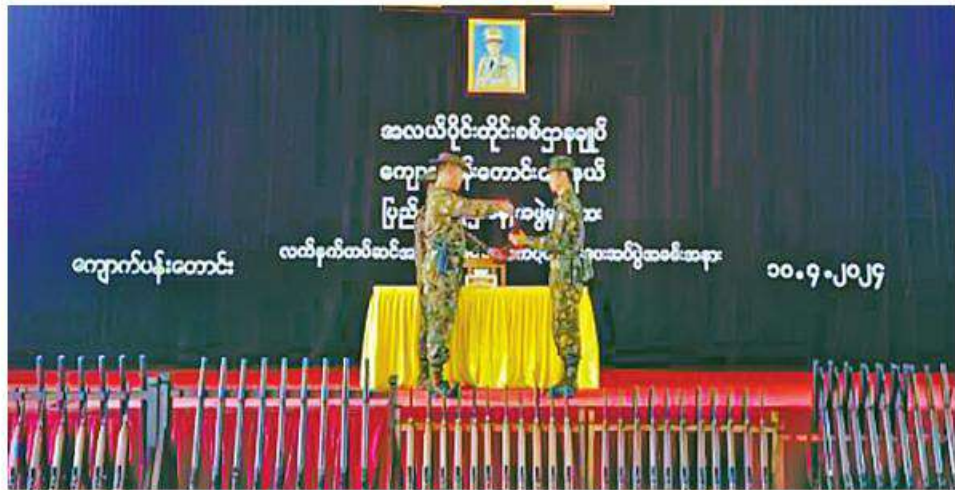
အလယ်ပိုင်းတိုင်းစစ်ဌာနချုပ် ကျောက်ပန်းတောင်းမြို့နယ် ပြည်သူ့စစ်(ဌာနေ)တပ်ဖွဲ့ဝင်များကို လက်နက်များ တပ်ဆင်ပေးခြင်းနှင့် ထောက်ပံ့ပစ္စည်းများ ပေးအပ်

နေပြည်တော် ဧပြီ ၁၀ မန္တလေးတိုင်းဒေသကြီး ကျောက်ပန်းတောင်းမြို့နယ်အတွင်းရှိ ပြည်သူ့စစ်(ဌာနေ)တပ်ဖွဲ့ဝင်များကို လက်နက်တပ်ဆင်ပေးခြင်းနှင့် ထောက်ပံ့ပစ္စည်းများ ပေးအပ်ခြင်းကို ယနေ့နံနက်ပိုင်းတွင် ကျောက်ပန်းတောင်းမြို့ရှိ နယ်မြေခံတပ်နယ်ခန်းမ၌ ပြုလုပ်ရာ အလယ်ပိုင်းတိုင်းစစ်ဌာနချုပ် ကျောက်ပန်းတောင်းတပ်နယ်မှ တာဝန်ရှိသူများ၊ ပြည်သူ့စစ်(ဌာနေ)တပ်ဖွဲ့ဝင်များနှင့် ဖိတ်ကြားထားသူများ တက်ရောက်ကြသည်။ ဦးစွာ တာဝန်ရှိသူတစ်ဦးက အမှာစကား ပြောကြားသည်။ ထို့နောက် တာဝန်ရှိသူများက ပြည်သူ့စစ်(ဌာနေ)တပ်ဖွဲ့ဝင်များအတွက် လက်နက်များ တပ်ဆင်ပေးခြင်းနှင့် ထောက်ပံ့ပစ္စည်းများ ပေးအပ်ရာ ပြည်သူ့စစ်(ဌာနေ)တပ်ဖွဲ့ဝင်များ ကိုယ်စား တာဝန်ရှိသူတစ်ဦးက ကျေးဇူးတင်စကားပြန်လည် ပြောကြားသည်။ ယင်းနောက် တာဝန်ရှိသူများသည် တပ်ဆင်ပေးအပ်လက်နက်များကို လိုက်လံကြည့်ရှုကြပြီး တက်ရောက်လာကြသည့် ပြည်သူ့စစ်(ဌာနေ)တပ်ဖွဲ့ဝင်များကို ရင်းရင်းနှီးနှီးလိုက်လံနှုတ်ဆက်ခဲ့ကြောင်း သတင်းရရှိသည်။