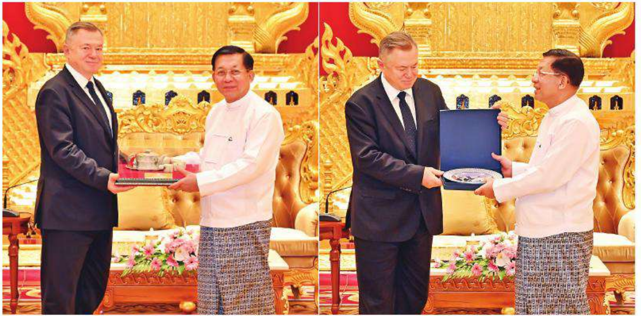
နိုင်ငံတော်စီမံအုပ်ချုပ်ရေးကောင်စီဥက္ကဋ္ဌ ခိုင်ငံတော်ဝန်ကြီးချုပ် ဝိုလ်ချုပ်မျိုးကြီးမင်းအောင်လှိုင်နှင့် ဥရောပအာရှစီးပွားရေးကော်မရှင် ဘုတ်အဖွဲ့ဝင် အကြီးစားစီးပွားရေးနှင့် ပေါင်းစည်းရေးဝန်ကြီး H.E. Mr. Sergei GLAZEV တို့ အမှတ်တရလက်ဆောင်ပစ္စည်းများ အပြန်အလှန်ပေးအပ်စဉ်။