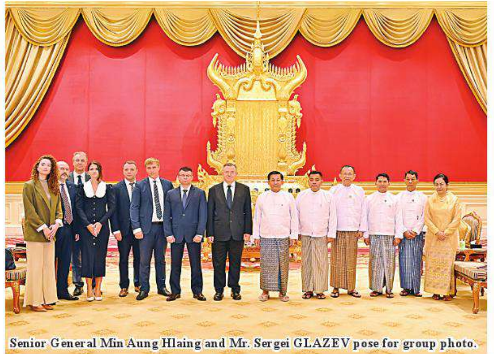
Senior General Min Aung Hlaing and Mr. Sergei GLAZEV pose for group photo.

In the meeting, issues related to mutual export of goods and direct payments between Myanmar and the European Asian Economic Commission, technical cooperation regarding agricultural products, tourism sector development and direct flights, the production of petroleum products and the production of mineral resources into high-grade finished products, cooperation in textile industries and cooperation in other fields between Myanmar and the European Asian Economic Commission were discussed. After the meeting, the Senior General and Mr. Sergei GLAZEV exchanged souvenirs and posed for a documentary photo. 100