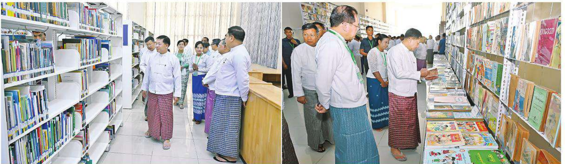
နိုင်ငံတော်စီမံအုပ်ချုပ်ရေးကောင်စီဥက္ကဋ္ဌ ခိုင်ငံတော်ဝန်ကြီးချုပ် ဝိုလ်ချုပ်မျိုးကြီးမင်းအောင်လှိုင် ဝင်းကျင်းပြသထားသည့် စာအုပ်စာစောင်များနှင့် အမျိုးသားစာကြည့်တိုက်ရှိ e-Library and Reading Room တို့ကို လှည့်လည်ကြည့်ရှုစဉ်။

ပွင့်လင်းစွာ အမြင်ချင်းဖလှယ် ဆွေးနွေး ခဲ့ကြသည်။ တွေ့ဆုံပွဲအပြီးတွင် ခိုင်ငံတော်စီမံ အုပ်ချုပ်ရေးကောင်စီဥက္ကဋ္ဌ ခိုင်ငံတော် ဝန်ကြီးချုပ်နှင့် ဥရောပအာရှစီးပွားရေး ကော်မရှင်ဘုတ်အဖွဲ့ဝင် အကြီးစား စီးပွားရေးနှင့် ပေါင်းစည်းရေးဝန်ကြီး တို့သည် အမှတ်တရလက်ဆောင်ပစ္စည်းများ အပြန်အလှန်ပေးအပ်ကြပြီး မှတ်တမ်းတင် ဓာတ်ပုံရိုက်ခဲ့ကြကြောင်း သတင်းရရှိသည်။