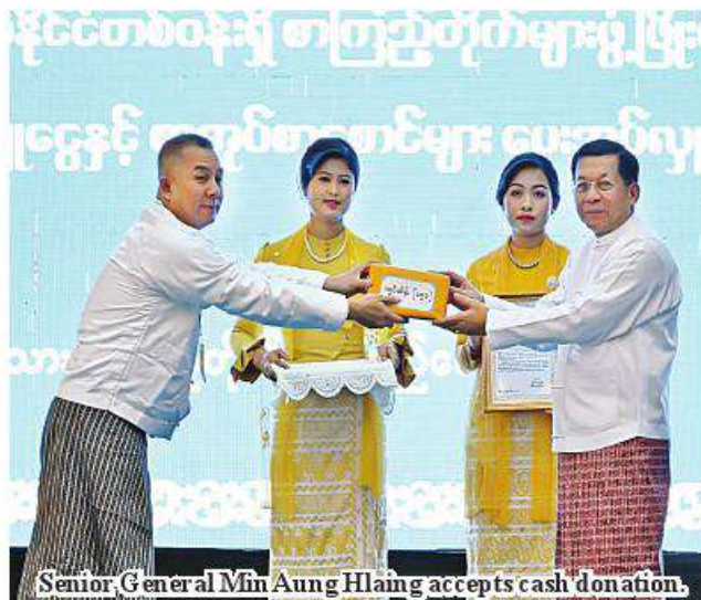
Senior General Min Aung Hlaing accepts cash donation.