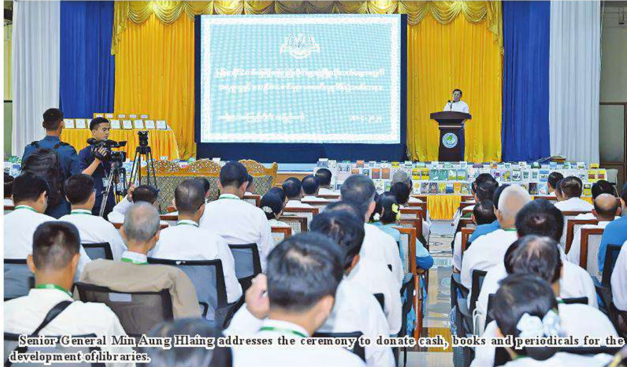
Senior General Min Aung Hlaing addresses the ceremony to donate cash, books and periodicals for the development of libraries.

Nay Pyi Taw April 10 A ceremony to donate cash and books and periodicals for development of libraries in the whole Myanmar was held at National Library here this morning, attended by Chairman of State Administration Council Prime Minister Senior General Min Aung Hlaing. Also present together with the Senior General were Joint SAC Secretary Lt-Gen Ye Win Oo and SAC members, union level officials, union ministers, the Nay Pyi Taw Council chair, senior military officers from Office of Commander-in-Chief, the Nay Pyi Taw Command commander, deputy ministers, departmental officials, donors, invited guests, officials of Nay Pyi Taw Libraries Foundation, members of