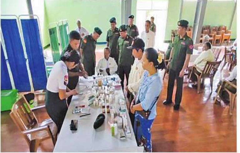
အနောက်မြောက်တိုင်းစစ်ဌာနချုပ် နယ်မြေစံဆေးကုသရေးအဖွဲ့က စစ်မှုထမ်းဟောင်း အဖွဲ့ဝင်များအား ကျန်းမာရေးစောင့်ရှောက်မှုလုပ်ငန်းများ ဆောင်ရွက်ပေးနေမှုကို နယ်မြေစံဆေးကုသရေးအဖွဲ့က ကြည့်ရှုအားပေးစဉ်။

ဆောင်ရွက်ပေးနေမှုများကို နယ်မြေစံ ဆေးကုသရေးအဖွဲ့က သွားရောက် ကြည့်ရှု အားပေးစကားပြောကြားပြီး စားသောက်ဖွယ်ရာများ ထောက်ပံ့ပေးအပ် ခဲ့ကြောင်း သတင်းရရှိသည်။