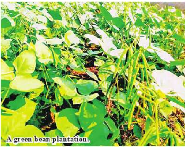
A green bean plantation.

It is known that the local farmers in Pwintphyu Township cultivate the green beans which are distributed by Mezali dam during the rain crop and summer crop growing season. In this summer crop