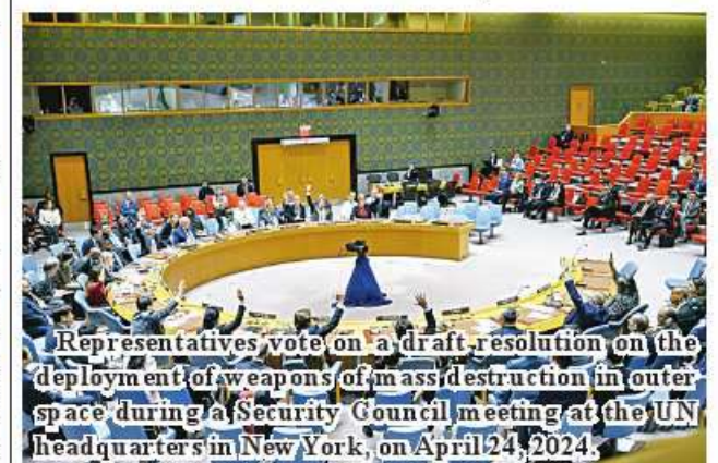
Representatives vote on a draft resolution on the deployment of weapons of mass destruction in outer space during a Security Council meeting at the UN headquarters in New York, on April 24, 2024.

The department also offers training and technology support to foster these entrepreneurs, promoting their products once they pass laboratory testing. 185