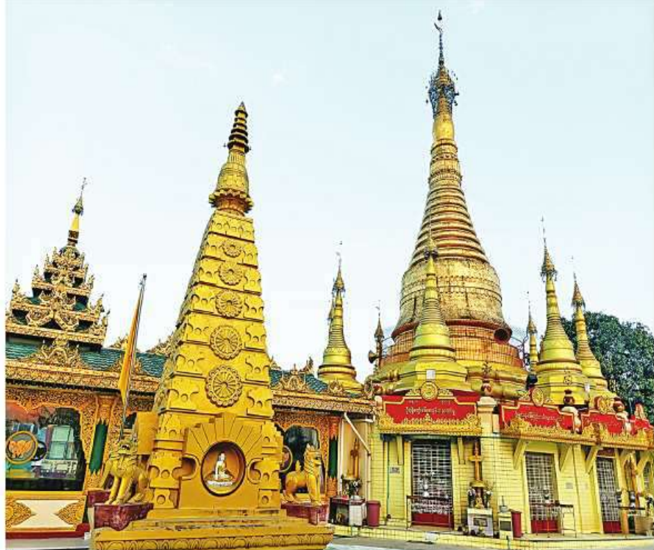
ဦးပါရဲစေတီအား ဖူးတွေ့ရစဉ်။

နေရာကိုလဲ တစ်ဆက်တည်းလမ်းညွှန်ပြောပြပေးကြ တယ်။ မြို့ခံမိတ်ဆွေပြောပြထားတဲ့အတိုင်း ဟင်္သာတ မြို့တွင်းကိုဝင်၊ အဓိကလမ်းမကြီးပေါ်ကနေ တည် တည်မောင်းနှင်လာ၊ တောင်ကုန်းအမြင့်နေရာကို ရောက်တာနဲ့ ညာဘက်ကိုကွေ့၊ လမ်းဆုံးရင်မြို့ကြီး စေတီကိုရောက်ပြီဆိုတဲ့ လမ်းညွှန်ချက်အတိုင်း မောင်း လာခဲ့တာ စေတီတော်ရှိရာကိုမရောက်ခင် ညာဘက် လမ်းချိုးကို ကွေ့ဝင်မောင်းနှင်ခြင်းမပြုရသေးခင် တောင်ကုန်းထိပ်လမ်းဘေးမှာ စောင့်ဆိုင်းနေကြတဲ့ မိတ်ဆွေတွေကို တွေ့မြင်လိုက်ရတယ်။ မိတ်ဆွေတွေကို