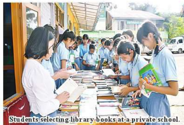
Students selecting library books at a private school.

Moreover, disciplines have been adopted that all private schools and international schools have to teach Myanmar language, Myanmar geography and Myanmar history to the students as compulsory subjects under the private education law and must arrange students to salute the State flag and