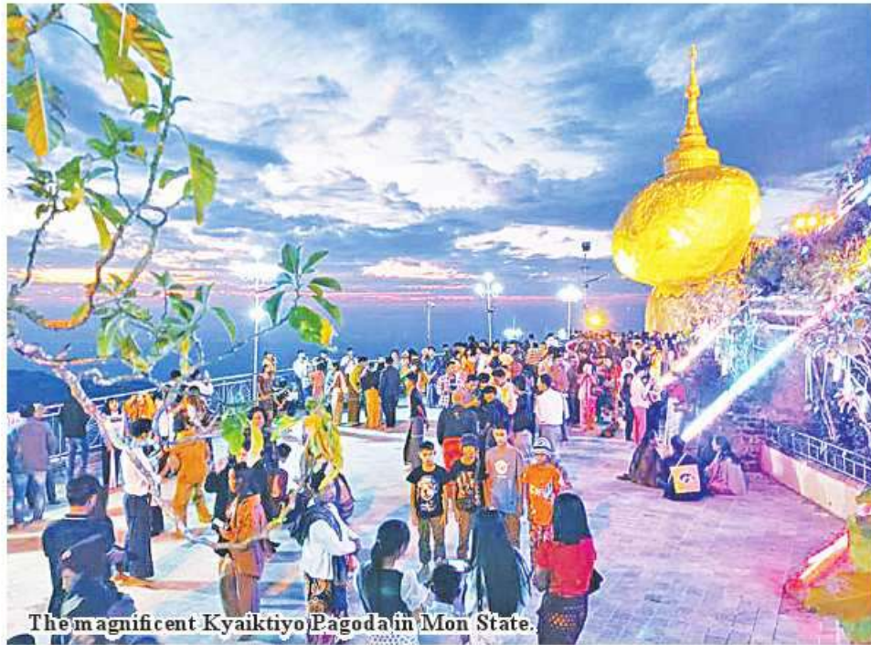
The magnificent Kyaiktiyo Pagoda in Mon State.

pilgrims are being driven to Kyaiktiyo Pagoda every day. It is also reported that hotels, guesthouses, free lodgings and restaurants are open for pilgrims.