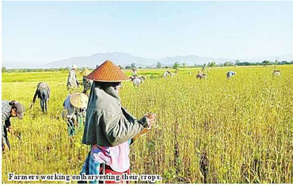
Farmers working on harvesting their crops.

Kalewa April 25 A total of 17,027 acres of oil crops planted in the winter crop season in Kalewa Township, Sagaing Region have been harvested,