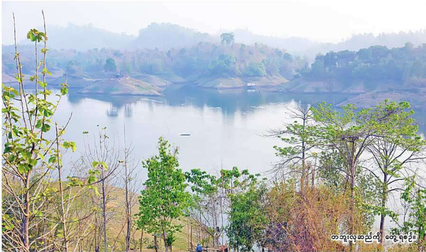
တဘူးလှဆည်ကို တွေ့ရစဉ်။

မန္တလေးတိုင်းဒေသကြီး ခရိုင် ငါးခရိုင်၌ ဆီထွက်သီးနှံများကို ငန်များသတ်မှတ်ပြီး စိုက်ကေ ၁၀ သိန်းကျော် စိုက်ပျိုးသွားမည် စာမျက်နှာ - ၂