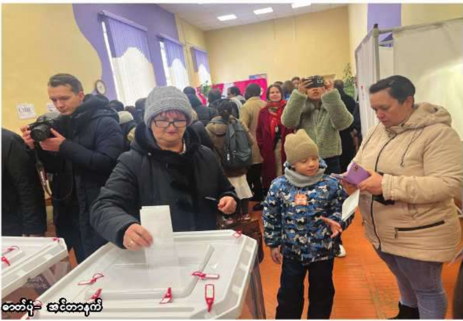
ဆက်ရိုး ဆင်တာနက်

ရုရှားနိုင်ငံ၏သမ္မတရွေးကောက်ပွဲတွင် မဲရုံများ၌ မဲပေးကြရာတွင် မဲပုံးအတွင်း မဲလက်မှတ်အသုံးပြုတိုက်ရိုက်ဆန္ဒမဲပေးခြင်း၊ အီလက်ထရွန်းနစ်မဲပေးစက်အသုံးပြုဆန္ဒမဲပေးခြင်းနှင့် Online စနစ် အသုံးပြုဆန္ဒမဲပေးခြင်းစသည့် နည်းလမ်း ၃ ခုတို့ဖြင့် ဆောင်ရွက်လျက်ရှိကြောင်း တွေ့ရှိရသည်။ မဲလက်မှတ်သုံးတိုက်ရိုက်မဲပေးမှုစနစ်ဖြင့် မဲပေးသူများမှာ