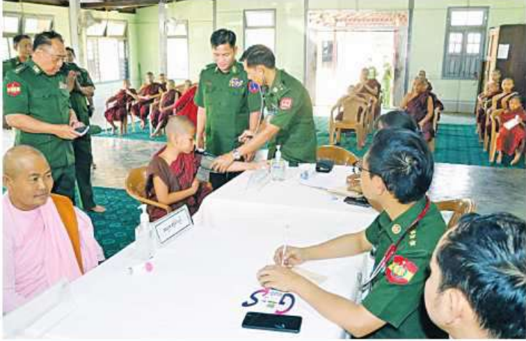
သံဃာတော်များနှင့် သာသနာ့ဇနနယ်ဝင်သီလရှင်များအား နယ်မြေစံဆေးကုသရေး အဖွဲ့က ကျန်းမာရေးစောင့်ရှောက်မှုလုပ်ငန်းများ ဆောင်ရွက်ပေးနေမှုကို မြောက်ပိုင်း တိုင်းစစ်ဌာနချုပ် တိုင်းမှူး ဝိုင်းထွန်းအောင်ထွေး ကြည့်ရှုအားပေးစဉ်။

နေပြည်တော် ဧပြီ ၂၅ - အဖွဲ့က အဆိုပါမြို့ရှိ အဘယရာမဝရီယတ္တိ ကျန်းမာရေးစောင့်ရှောက်မှုလုပ်ငန်းများ ဆောင်ရွက်ပေးသည်။ သံဃာတော်များနှင့် သာသနာ့ဇနနယ်ဝင် သီလရှင်များကို ယနေ့တွင် မြောက်ပိုင်း တိုင်းစစ်ဌာနချုပ် နယ်မြေစံဆေးကုသရေး အဖွဲ့က အဆိုပါမြို့ရှိ အဘယရာမဝရီယတ္တိ စာသင်တိုက်၌ ကျန်းမာရေးစောင့်ရှောက် မှုလုပ်ငန်းများ ဆောင်ရွက်ပေးသည်။ ထိုသို့ဆောင်ရွက်ပေးရာ၌ ဆေးကုသ ရေးအဖွဲ့က သံဃာတော် ၃၇ ပါးနှင့်